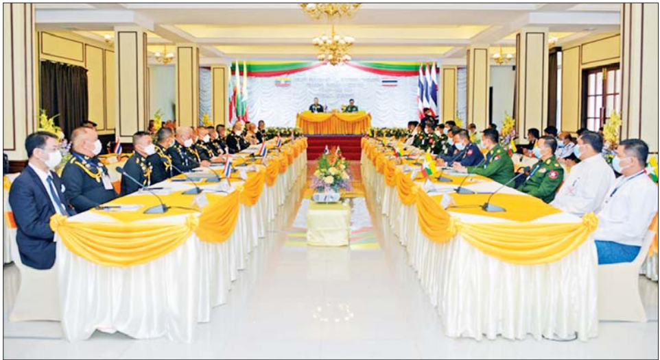
ပူးပေါင်းဆောင်ရွက်မှုဆိုင်ရာကိစ္စ၊ နှစ်နိုင်ငံနယ်နိမိတ် ညနေပိုင်းတွင် အစည်းအဝေးကို ရပ်နားခဲ့ကြောင်း ဆိုင်ရာကိစ္စ၊ နယ်စပ်ဒေသဆိုင်ရာကိစ္စနှင့် အခြား သတင်းရရှိသည်။ ကိစ္စရပ်များအား ကဏ္ဍအလိုက် ဆွေးနွေးကြပြီး သတင်းစဉ်

ထို့နောက် နှစ်နိုင်ငံအဖွဲ့ခေါင်းဆောင်များသည် တက်ရောက်လာကြသူများနှင့်အတူ စုပေါင်း မှတ်တမ်းတင် ဓာတ်ပုံရိုက်ကြပြီး အဖွဲ့ဝင်များကို ရင်းရင်းနှီးနှီး နှုတ်ဆက်ကာ ဖွင့်ပွဲအခမ်းအနားကို ရုပ်သိမ်းသည်။ ယင်းနောက် မြန်မာ-ထိုင်း ဒေသဆိုင်ရာနယ်ခြားကော်မတီအတွင်းရေးမှူးအဖွဲ့ အစည်းအဝေးကို ဆက်လက်ကျင်းပရာ မြန်မာကိုယ်စားလှယ်အဖွဲ့ အတွင်းရေးမှူး ကာကွယ်ရေးဦးစီးချုပ်ရုံး(ကြည်း)မှ ဗိုလ်မှူးချုပ် ခိုင်လင်း၊ ထိုင်းကိုယ်စားလှယ်အဖွဲ့ အတွင်းရေးမှူး Gen. Satorn Sireyanon နှင့် မြန်မာ-ထိုင်းနယ်ခြားကော်မတီ အဖွဲ့ဝင်များက (၃၃)ကြိမ်မြောက် မြန်မာ-ထိုင်း ဒေသဆိုင်ရာ နယ်ခြားကော်မတီအစည်းအဝေး မှတ်တမ်းအား ပြန်လည် သုံးသပ်ခြင်း၊ ယုံကြည်မှု တည်ဆောက်ခြင်း ဆိုင်ရာကိစ္စ၊ နယ်စပ်ဒေသ ပူးပေါင်းဆောင်ရွက်မှု ကိစ္စ၊ မူးယစ်ဆေးဝါး တားဆီးကာကွယ်ရေး