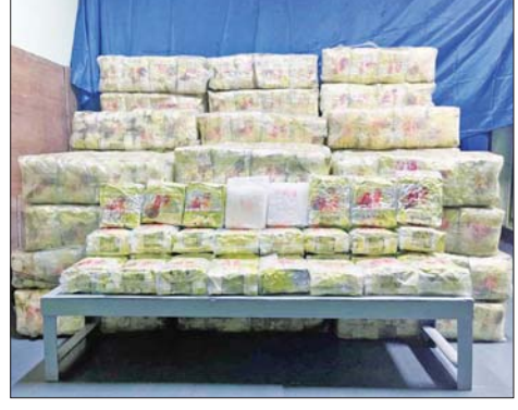
မူးယစ်ဆေးဝါးသယ်ဆောင်လာသော စက်လှေနှင့် သိမ်းဆည်းရမိ မူးယစ်ဆေးဝါးများ။

နေပြည်တော် ဇွန် ၂၈ ရခိုင်ကမ်းရိုးတန်း ကမ်းလွန်ပင်လယ်ပြင်အတွင်း လုံခြုံရေးဆောင်ရွက်လျက်ရှိသော တပ်ဖွဲ့ဝင်များသည် ဇွန် ၂၅ ရက် ည ၉ နာရီ မိနစ် ၅၀ ခန့်တွင် မသင်္ကာဖွယ် စက်လှေတစ်စင်း တွေ့ရှိသဖြင့် စစ်ဆေးရန်အတွက် မီးအချက်ပြ ခေါ်ယူခဲ့သော်လည်း စက်လှေမှာ ရပ်တန့်ခြင်းမရှိဘဲ မောင်းနှင်ထွက်ပြေးသဖြင့် လိုက်လံဖမ်းဆီးခဲ့ရာ မြေပုံမြို့နယ် ကျွန်းသာယာ အနောက်တောင်ဘက် ၉ မိုင်ခန့် အကွာသို့အရောက်၌ လှေသားများမရှိတော့သော အဆိုပါစက်လှေကို တွေ့ရှိခဲ့သည်။ အဆိုပါ စက်လှေကို သွားရောက်စစ်ဆေးခဲ့ရာ အလျား ၆၇ ပေ၊ အနံ ၁၉ ပေ၊ ရေစူး ၁၀ ပေခန့်ရှိ ငါးဖမ်းစက်လှေဖြစ်ကြောင်း သိရှိရပြီး စက်လှေပေါ်မှ ငါးဖမ်းပိုက်များဖြင့် ဖုံးအုပ်ထားသည့် ICE မူးယစ်ဆေး ဆာလာအိတ် တစ်အိတ်လျှင် ၂၀ ကီလိုဂရမ်ပါ အိတ် ၅၀ (စုစုပေါင်းခန့်မှန်း တန်ဖိုး ငွေကျပ်သိန်း ၂၅၀၀၀ ကျော်) ကို တွေ့ရှိသိမ်းဆည်းရမိခဲ့သည်။ သိမ်းဆည်းရမိသည့် စက်လှေနှင့် မူးယစ်ဆေးဝါးများကို ကျောက်ဖြူမြို့မရဲစခန်းသို့ စနစ်တကျ လွှဲပြောင်းအပ်နှံ၍ လုပ်ထုံးလုပ်နည်းနှင့်အညီ ဆက်လက်ဆောင်ရွက်လျက်ရှိကြောင်း သတင်းရရှိသည်။ သတင်းစဉ်