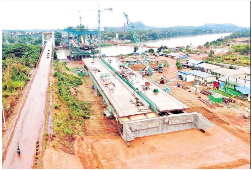
ရန်ကုန် - မြဝတီကားလမ်းပေါ်၌ ဂျိုင်း (ကော့ကရိတ်) တံတားကြီး တည်ဆောက်နေစဉ်။