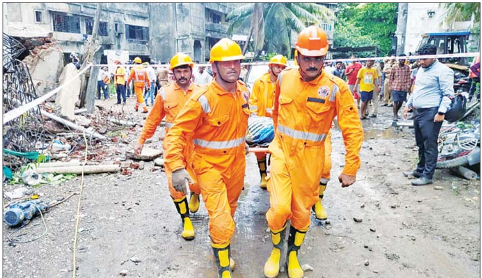
အဆောက်အအုံပြိုကျရာ၌ ကယ်ဆယ်ရေးအဖွဲ့များက ကယ်ဆယ်ရေးလုပ်ငန်းများ ဆောင်ရွက်ကြစဉ်။

တိုးလာခဲ့သည်။ ပျက်စီး ယိုယွင်းနေသော အဆောက်အအုံတစ်လုံး ပြိုကျမှုဖြစ်ပွားခဲ့ရာ လူအတော်များများ အဆောက်အအုံအပျက်အစီးများကြားတွင် ပိတ်မိနေခဲ့သည်။ ဒဏ်ရာရရှိသူ ၂၇ ဦးအနက် ၁၄ ဦး သေဆုံးခဲ့ပြီး ကိုးဦးမှာ ဆေးကုသမှုခံယူပြီးနောက် ဆေးရုံမှ ဆင်းလာပြီဖြစ်ကြောင်းနှင့် ကျန်လေးဦးမှာ ပြည်သူ့ဆေးရုံတွင် ဆေးကုသမှု ဆက်လက်ခံယူလျက်ရှိကြောင်း မွမ်ဘိုင်းမြို့နယ်စီမံအဖွဲ့က ၎င်း၏ဝက်ဘ်ဆိုက်တွင် ဖော်ပြထားသည်။ ဇွန်လမှ စက်တင်ဘာလအထိ ဖြစ်ပေါ်မည့် မိုးရာသီမတိုင်မီ မွမ်ဘိုင်းတွင် ပျက်စီးယိုယွင်းနေသော အဆောက်အအုံ ၃၃၇ လုံး ရှိကြောင်းနှင့် လွန်ခဲ့သောနှစ်က ငွေ၅ လုံး ပြိုကျခဲ့ကြောင်း မွမ်ဘိုင်းမြို့နယ်စီမံအဖွဲ့က ပြောသည်။