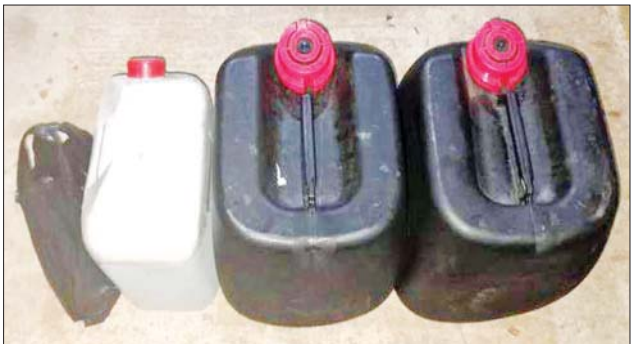
၂၀၂၂ ခုနှစ် ဇွန်လ ၂၆ ရက်တွင် ရွှေပြည်သာမြို့နယ်၌ တရားခံများနှင့်အတူ ဖမ်းဆီးရမိခဲ့သည့် ဖောက်ခွဲရေးပစ္စည်းများမှတ်တမ်းဓာတ်ပုံ။