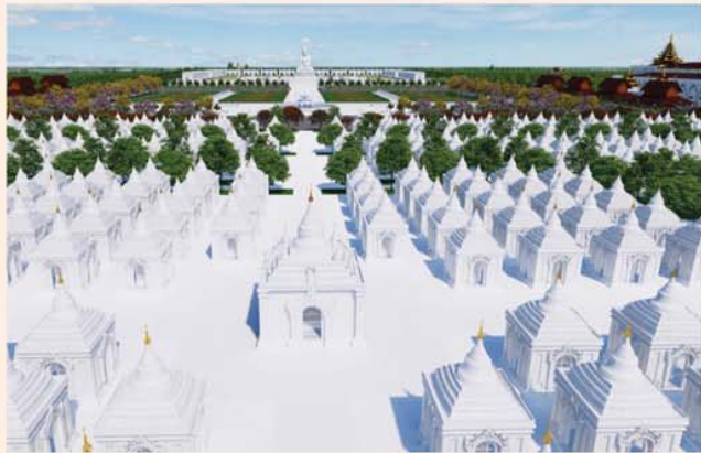
ကျောက်စာရုံစေတီ(၁၂ x ၁၂x ၁၈)ပေ ၁ ဆူ တန်ဖိုး- ၂၇၉ သိန်း