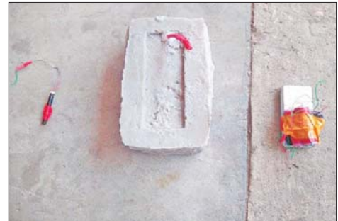
၂၀၂၂ ခုနှစ် ဖေဖော်ဝါရီလ ၁ ရက်တွင် သာကေတမြို့နယ် ရန်အောင်ရပ်ကွက်၌ လက်လုပ်မိုင်း တွေ့ရှိခဲ့သည့် မှတ်တမ်းဓာတ်ပုံ။

> ၂၀၂၂ ခုနှစ်၊ ဇန်နဝါရီ ၁ ရက်တွင် ကျောက်တံတားမြို့နယ် အမှတ် (၁) ရပ်ကွက်ရှိ မြို့နယ်ရဲတပ်ဖွဲ့မှူးရုံးအား လက်လုပ်မိုင်း တစ်လုံးဖြင့် ပစ်ခတ်ဖောက်ခွဲခဲ့ကြောင်း။ > ဖေဖော်ဝါရီ ၁ ရက်တွင် သာကေတ မြို့နယ် ရန်အောင် ရပ်ကွက်၌ လက်လုပ်မိုင်း တစ်လုံးဖြင့် ပစ်ခတ်ဖောက်ခွဲခဲ့ကြောင်း။ သတင်းပေးတိုင်ကြားနိုင်သို့ဖြစ်ပါ၍ ဖမ်းဆီးရမိ တရားခံများကို ဥပဒေအရ ထိရောက်စွာ အရေးယူနိုင်ရေး ဖြစ်ပြီး အကြမ်းဖက်မှုဆောင်ရွက် နေသူများကို ပြည်သူတစ်ရပ်လုံး က ဝိုင်းဝန်းကာကွယ် တိုက်ဖျက် ကြရန်နှင့် ပြစ်မှုကျူးလွန်ရာတွင် ပါဝင်ပတ်သက်သူများ၊ နောက် ကွယ်မှ ထောက်ပံ့ပေးလျက်ရှိ သော ဆက်စပ်တရားခံများ အမြန်ဆုံး ဖမ်းဆီးရမိရေးအတွက် သတင်းပေးတိုင်ကြားနိုင်ပါ သွားလာနေထိုင်မှု သတင်းများ ရရှိပါက သက်ဆိုင်ရာသို့ လျှို့ဝှက် စွာ သတင်းပေး တိုင်ကြားနိုင်ပါ ကြောင်း၊ သတင်းပေးသူနှင့် ဖမ်းဆီးပေးသူများကို ထိုက်တန် စွာ လျှို့ဝှက်၍ ဆုငွေများ ချီးမြှင့် ပေးလျက်ရှိကြောင်းနှင့် မြို့ရွာများ အမြန်ဆုံးအေးချမ်းတည်ငြိမ်ရေး အတွက် ပြည်သူတစ်ရပ်လုံး ပူးပေါင်းပါဝင်ကြိုးပမ်း ဆောင် ရွက်နိုင်ပါရန် မေတ္တာရပ်ခံ အသိပေးထားကြောင်း သိရသည်။ သတင်းစဉ်