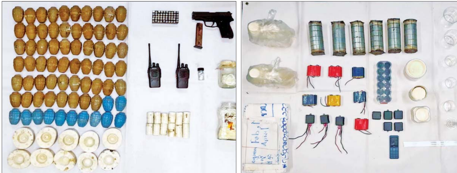
၂၀၂၂ ခုနှစ် ဇွန် ၂၆ ရက်တွင် ရွှေပြည်သာမြို့နယ်၌ တရားခံများနှင့်အတူ ဖမ်းဆီးရမိခဲ့သည့် လက်နက်ခဲယမ်းနှင့် ဖောက်ခွဲရေးပစ္စည်းများ မှတ်တမ်းဓာတ်ပုံ။