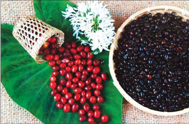
ခူးဆွတ်ပြီး ကော်ဖီစေ့ပုံ။

ကျွန်တော့် အစ်ကိုကြီးကား ဖျာပုံမြို့နယ် သလိပ်ကြီးကျေးရွာတွင် နေသူဖြစ်သည်။ အသက် ၈၀ ကျော်ပြီ။ သို့သော် ငယ်စဉ်က ၁၀ တန်းအထိ ကျောင်းနေခဲ့သူဖြစ်ပြီး ကိုယ်ပိုင်လယ်လုပ်ခဲ့သူ ဖြစ်သည်။ လယ် ၁၅ ဧက ခန့်ပိုင်သည်။ အသက် ၇၀ ကျော်မှ ကိုယ်တိုင်လယ်မလုပ်တော့ဘဲ ညီ များ၊ တူများကို လွှဲထားပေးခြင်းဖြစ်သည်။ သလိပ် ကြီးရွာတွင် လျှပ်စစ်မီးမရသေးသော်လည်း ကျေးလက်မီးလင်းရေး အစီအစဉ်ဖြင့် နေရောင်ခြည် စွမ်းအင်ဖြင့် မီးရသည်။ ရပ်မြင်သံကြား ကြည့်၍ ရသည်။ မြန်မာ့ရုပ်မြင်သံကြားသတင်းကို လက် မလွတ်တမ်းကြည့်သူဖြစ်၍ ဗဟုသုတရှိသည်။