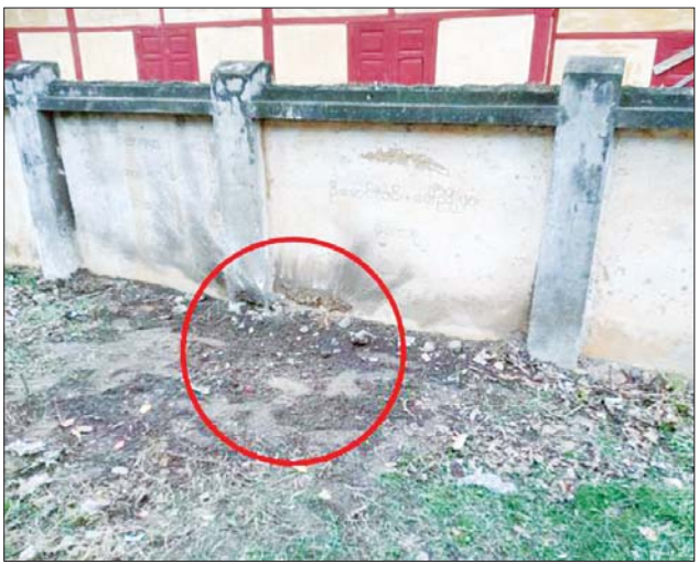
ထီးချိုင့်မြို့နယ် မြတောင်ကျေးရွာရှိ အခြေခံပညာအထက်တန်းကျောင်းအရှေ့ ခြံစည်းရိုး အုတ်တံတိုင်းအနီး၌ လက်လုပ်အသံမိုင်းတစ်လုံး ပေါက်ကွဲခဲ့မှု မှတ်တမ်းဓာတ်ပုံ။

နေပြည်တော် ဇွန် ၂၈ NUG အမည်ခံအကြမ်းဖက်အဖွဲ့ နှင့် ၎င်း၏လက်အောက်ခံ နိုင်ငံရေးအစွန်းရောက် အကြမ်းဖက်များက အနာဂတ် ရင်သွေးငယ်များ၏ ပညာသင်ကြားသင်ယူခွင့် အခွင့်အလမ်းများ ပျက်ပြား၍ ပညာမဲ့လူတန်းစားများ ဖြစ်ပေါ်လာစေရန်နှင့် ကျောင်းသားကျောင်းသူ၊ ဆရာ၊ မိဘများအား အထိတ်တလန့် ဖြစ်စေရန် ယုတ်မာရိုင်းစိုင်းသော ရည်ရွယ်ချက်များဖြင့် စာသင်ကျောင်းများတွင် ဆန့်ကျင်ခြိမ်းခြောက်စာများ ရေးသားချိတ်ဆွဲ၍ ခြိမ်းခြောက်အကြမ်းဖက်ခြင်းများ၊ ပညာရေးအဆောက်အအုံများ မိုင်းဖောက်ခွဲခြင်းများ လုပ်ဆောင်လျက်ရှိသည်ကို တွေ့ရှိရသည်။ ထိုသို့ လုပ်ဆောင်လျက်ရှိရာ ဇွန် ၂၇ ရက် နံနက် ၉ နာရီ ၄၅ မိနစ်တွင် စစ်ကိုင်းတိုင်းဒေသကြီး ထီးချိုင့်မြို့နယ် မြတောင်ကျေးရွာရှိကျောင်းသားကျောင်းသူ ၁၉၆ ဦး ပညာသင်ကြားလျက်ရှိသည့် အခြေခံပညာအထက်တန်း