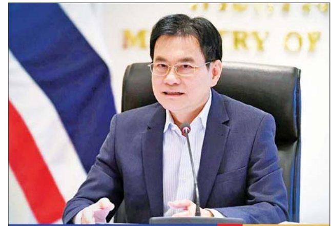
ထိုင်းနိုင်ငံ ဒုတိယဝန်ကြီးချုပ်နှင့် ကူးသန်းရောင်းဝယ်ရေးဝန်ကြီး ဂျူရင်လက်ခိဆာနာဗိဇိတ်။

တပ်ဆင်ရမည့် ညွှန်ကြားချက်ကြောင့်မဟုတ်ကြောင်း ဂျူရင်က ပြောသည်။ နှစ်ဦးစလုံးကို တစ်ပတ်ကြာသီးသန့်ခွဲခြားနေထိုင်ရန် အကြံပြုထားကြောင်း ပြည်တွင်းမီဒီယာများတွင် ဖော်ပြသည်။