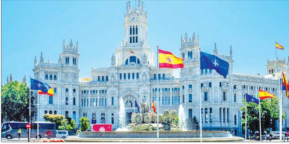
နေတိုးအစည်းအဝေးကို ကြိုဆိုသည့် ပုံရိပ်တစ်ခုကို တွေ့ရစဉ်။

မက်ဒရစ် ဇွန် ၂၈ မြောက်အတ္တလန္တိတ်စာချုပ် အဖွဲ့ (နေတိုး) အစည်းအဝေးကို စပိန်နိုင်ငံ မြို့တော် မက်ဒရစ်တွင် ဇွန် ၂၉ ရက်မှစကာ နှစ်ရက်ကြာ ကျင်းပသွားမည်ဖြစ်သည်။ အဖွဲ့ဝင် ၃၀ နိုင်ငံမှ ခေါင်းဆောင်များသာမက ဖင်လန်နှင့် ဆွီဒင်တို့မှ ခေါင်းဆောင်များလည်း ပါဝင်တက်ရောက်မည်ဖြစ်သည်။ ထို့အပြင် ဂျပန်နိုင်ငံ အပါအဝင် အာရှ - ပစိဖိတ်နိုင်ငံများလည်း တက်ရောက်မည်ဖြစ်သည်။ အဆိုပါ အစည်းအဝေးတွင် လာမည့် ဆယ်စုနှစ်အတွက် မဟာမိတ်နိုင်ငံများ၏ နိုင်ငံရေးနှင့် စစ်ရေးဆိုင်ရာ ဖွံ့ဖြိုးတိုးတက်ရေး