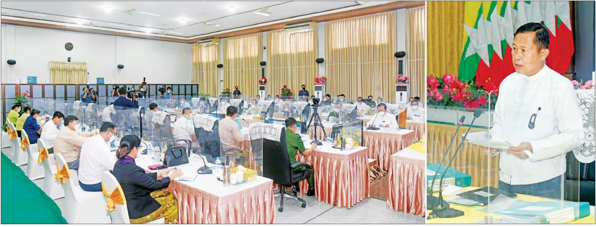
နိုင်ငံတော်စီမံအုပ်ချုပ်ရေးကောင်စီ ဒုတိယဥက္ကဋ္ဌ ဒုတိယဝန်ကြီးချုပ် ဒုတိယဗိုလ်ချုပ်မှူးကြီး စိုးဝင်း တရားမဝင်ကုန်သွယ်မှုတိုက်ဖျက်ရေး ဦးဆောင်ကော်မတီ လုပ်ငန်းညှိနှိုင်းအစည်းအဝေး(၃/၂၀၂၂)တွင် အမှာစကားပြောကြားစဉ်။

နေပြည်တော် ဇွန် ၂၈ တရားမဝင်ကုန်သွယ်မှုတိုက်ဖျက်ရေး ဦးဆောင်ကော်မတီ လုပ်ငန်းညှိနှိုင်းအစည်းအဝေး(၃/၂၀၂၂)ကို ယနေ့မွန်းလွဲ ၂ နာရီတွင် နေပြည်တော်ရှိ စီးပွားရေးနှင့် ကူးသန်းရောင်းဝယ်ရေးဝန်ကြီးဌာန ညီလာခံခန်းမ၌ ကျင်းပရာ တရားမဝင်ကုန်သွယ်မှုတိုက်ဖျက်ရေး ဦးဆောင်ကော်မတီဥက္ကဋ္ဌ နိုင်ငံတော်စီမံအုပ်ချုပ်ရေး ကောင်စီ ဒုတိယဥက္ကဋ္ဌ ဒုတိယဝန်ကြီးချုပ် ဒုတိယဗိုလ်ချုပ်မှူးကြီး စိုးဝင်း တက်ရောက်အမှာစကား ပြောကြားသည်။ အစည်းအဝေးသို့ ပြည်ထောင်စုဝန်ကြီး ဦးဝင်းရှိန်၊ ဒုတိယဝန်ကြီးများ၊ နေပြည်တော်ကောင်စီဝင်၊ အခွန်အယူခံခုံအဖွဲ့ဥက္ကဋ္ဌ၊ အမြဲတမ်းအတွင်းဝန်များ၊ ညွှန်ကြားရေးမှူးချုပ်များနှင့် တာဝန်ရှိသူများ တက်ရောက်ကြပြီး တိုင်းဒေသကြီးနှင့် ပြည်နယ်များမှ တာဝန်ရှိသူများက ဗီဒီယိုကွန်ဖရင့်စနစ်ဖြင့် တက်ရောက်ကြသည်။ စာမျက်နှာ ၃ ကော်လံ ၁ *