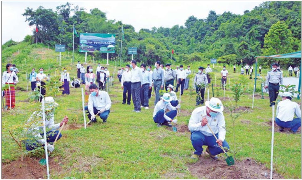
ပြည်ထောင်စုဝန်ကြီး ဦးခင်မောင်ရီနှင့် အဖွဲ့ဝင်များ သစ်ပင်ပျိုးပင်များ စိုက်ပျိုးနေမှုကို ကြည့်ရှုအားပေးစဉ်။

သစ်တောဦးစီးဌာနအနေဖြင့် ၂၀၂၂ ခုနှစ် မိုးရာသီတွင် တစ်နိုင်လုံးအတိုင်းအတာဖြင့် ပျိုးပင် ၉,၆၆၁,၄၆၇ ပင်ကို လူထုလှုပ်ရှားမှုအသွင်ဖြင့် စိုက်ပျိုးခြင်း၊ လူထုဖြန့်ဝေခြင်းများ ဆောင်ရွက် လျက်ရှိကြောင်း သိရသည်။ သတင်းစဉ်