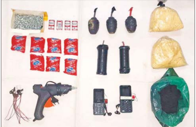
၂၀၂၂ ခုနှစ် ဇွန်လ ၂၆ ရက်တွင် သာကေတမြို့နယ် အမှတ်(၂) ရပ်ကွက် စာတိုက် (၂) လမ်း အိမ်အမှတ် (ခ/၁၆) ၌ သိမ်းဆည်းရမိခဲ့သည့် ဖောက်ခွဲရေးပစ္စည်းများ မှတ်တမ်းဓာတ်ပုံ။