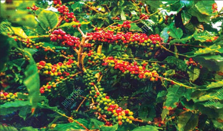
အောင်မြင်ဖြစ်ထွန်းနေသည့် ကော်ဖီသီးနံပုံ

ဓာတ်မြေဩဇာမပေးနိုင်တော့ သဘာဝ မြေဩဇာဆိုပြီး ပိုက်ဆံလျှော် မျိုးစေ့တွေလာ ပြီးပေးတယ်။ ပထမတော့ ငါလည်းဒီလောက်တန်ဖိုး မထားပါဘူး။ သူတို့ရှင်းပြတာကို လျှောက်ပြောနေ တယ်ထင်တာ။ အဲ သူတို့ပြန်သွားမှ ကျွန်တော့်က ဖိုးပျော့ပြောမှ ဒီပိုက်ဆံလျှော်က တကယ်ကောင်းတဲ့ သစ်စိမ်းမြေဩဇာဆိုတာသိရတယ်။ အဲဒါနဲ့ မင်း တပည့်ပြောတာက မင်းတို့ကော်ဖီ အစည်းအဝေး လုပ်နေတယ်ဆို။ မင်းတို့နဲ့ကွာ။ အလုပ်မရှိ အလုပ် ရှာ။ ဘာမဟုတ်တဲ့ ကော်ဖီများ အစည်းအဝေးလုပ်နေ ရသေးတယ်။ စပါးတို့၊ မြေပဲတို့၊ ပြောင်းဖူးတို့၊ နေကြာတို့ အစည်းအဝေးလုပ်တယ်ဆိုရင် ငါလက်ခံ ပါတယ်။ အခုတော့ ကော်ဖီဆိုတာက မြို့ကလူတွေပဲ သောက်တာ။ ဒီတော့သားတွေနဲ့ ဘာမှမဆိုင်ပါဘူး။ ကဲ ပြောစမ်းပါဦး။ ကော်ဖီစိုက်ပျိုးရေးကို ဘာကြောင့် ရေးကြီးခွင့်ကျယ်လုပ်ပြီး အစည်းအဝေးလုပ်နေရ တာလဲ။”