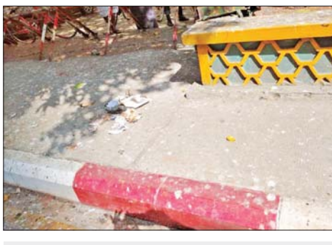
၂၀၂၂ ခုနှစ် ဇန်နဝါရီလ ၁ ရက်တွင် ကျောက်တံတားမြို့နယ် အမှတ် (၁) ရပ်ကွက်ရှိ မြို့နယ်ရဲတပ်ဖွဲ့မှူးရုံးရှေ့၌ လက်လုပ်မိုင်း ပေါက်ကွဲခဲ့သည့် မှတ်တမ်းဓာတ်ပုံ။