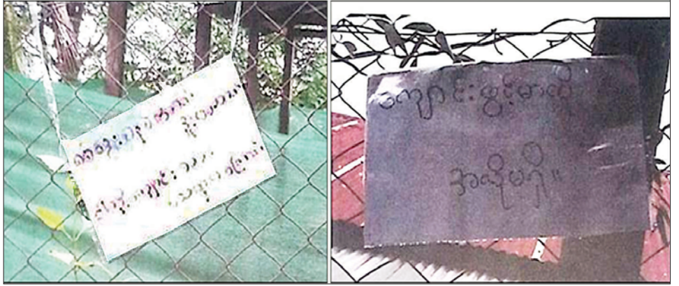
သံတောင်ကြီးမြို့နယ် ရွှေညောင်ပင်ကျေးရွာရှိ အခြေခံပညာအလယ်တန်းကျောင်းခြံစည်းရိုး၌ အကြမ်းဖက် သမားများ ချိတ်ဆွဲထားသည့် ခြိမ်းခြောက်စာကို တွေ့ရစဉ်။

ထိုသို့ဆောင်ရွက်လျက်ရှိရာ ဇွန် ၂၂ ရက် နံနက် ၉ နာရီတွင် ရှမ်းပြည်နယ်(တောင်ပိုင်း) ကလေး မြို့နယ် အောင်ပန်းမြို့ သာမိုင်းခမ်းကျေးရွာ မူလွန် ကျောင်း Grade-4 စာသင်ခန်းအတွင်းနံရံထောင့်၌ အကြမ်းဖက်သမားများက ခြိမ်းခြောက်စာတစ်စောင် နှင့်အတူ Keypad ဖုန်းဖြင့် ချိတ်ဆက်ထားသည့် လက်လုပ်မိုင်းတစ်လုံး လာရောက်ချထားသည်ကို တွေ့ရှိရကြောင်း သတင်းအရ လုံခြုံရေးတပ်ဖွဲ့ဝင်များ က သွားရောက်စစ်ဆေးပြီး လက်လုပ်မိုင်းကို စနစ်တကျ ရှင်းလင်းခဲ့ကြောင်း သိရသည်။ အလားတူ ဇွန် ၂၂ ရက် နံနက် ၈ နာရီခန့်တွင် ကရင်ပြည်နယ် သံတောင်ကြီးမြို့နယ် ရွှေညောင်ပင်