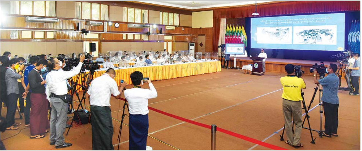
သတင်းစာရှင်းလင်းပွဲတွင် သတင်းထောက်များ၏ သိရှိလိုသည်များကို ပြန်လည်ဖြေကြားစဉ်။

ပဋိညာဉ်စာတမ်းအပိုဒ်(၂)အရ ပေါ်ပေါ်ထင်ထင်ချိုးဖောက်ရာ ရောက်ကြောင်း၊ ၎င်းတို့အနေဖြင့် မိမိတို့နိုင်ငံ၏ ပြည်တွင်းရေးကို ဝင်ရောက်စွက်ဖက်ပိုင်ခွင့်လည်း မရှိကြောင်း၊ ၎င်းတို့ပြောနေသည့် NUG အစိုးရကို လက်ခံလျှင် ၎င်းသံအမတ်နှင့် ၎င်း၏ သံရုံးကို အဆိုပါ NUG အစိုးရရုံးစိုက်သည့်နေရာသို့ ရွှေ့ပြောင်းသွားရမည်ဖြစ်ကြောင်း၊ မိမိကဲ့သို့ အေးချမ်းစွာနေထိုင်လိုသည့် မြန်မာနိုင်ငံသားအားလုံးကို စော်ကားရာရောက်ကြောင်း၊ ထိုအပြုအမူများကို မြန်မာနိုင်ငံသား