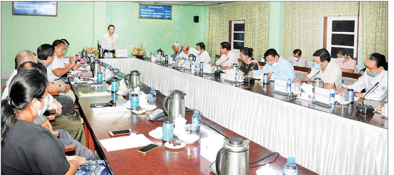
ပြည်ထောင်စုဝန်ကြီး ဦးမောင်မောင်အုန်း “ရုပ်ရှင်၊ ဂီတ၊ သဘင် ပဒေသာကပွဲ” ကျင်းပရေး ဒုတိယအကြိမ် လုပ်ငန်းညှိနှိုင်းအစည်းအဝေးတွင် ဆွေးနွေးပြောကြားစဉ်။

ရုပ်ရှင်၊ ဂီတ၊ သဘင် ပဒေသာကပွဲကြီးကို ကျင်းပပြုလုပ်ပေးခြင်းဖြင့် အနုပညာရှင်များ၏ စားဝတ်နေရေးကို အထောက်အကူပြုနိုင်မည် ဖြစ်သကဲ့သို့ အနုပညာရှင်များအနေဖြင့် မိမိတို့၏ အနုပညာအလုပ် များကိုလည်း ပြန်လည်စတင် လှုပ်ရှားဆောင်ရွက်နိုင်ကြမည်ဖြစ် ကြောင်း၊ ထိုကဲ့သို့ ဆောင်ရွက်ရာတွင် လက်တွေ့ကျပြီး ဖြစ်သင့် ဖြစ်ထိုက်သော နည်းလမ်းများကိုသာ ဆွေးနွေးဆောင်ရွက်ပေးကြစေလို