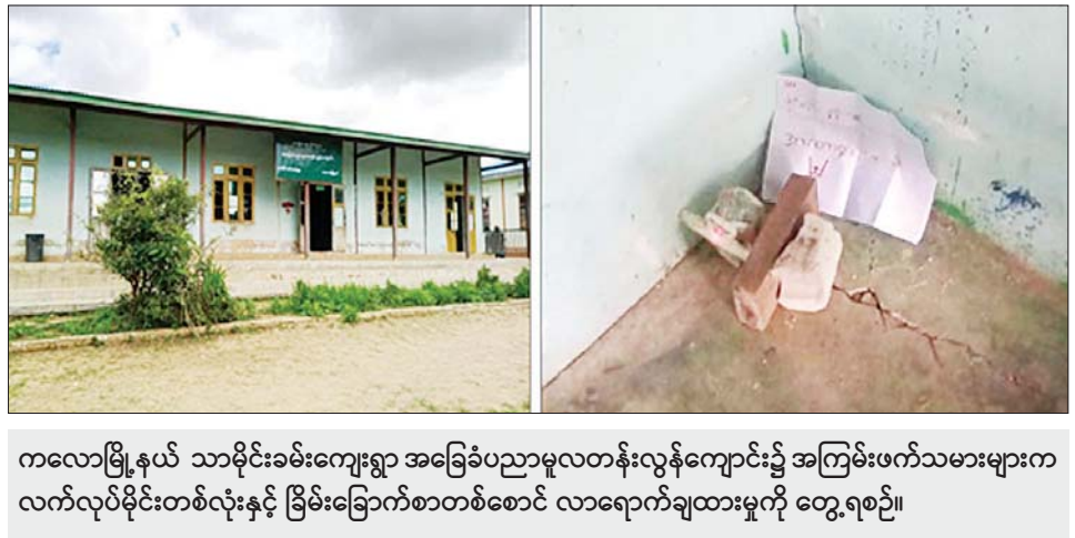
ကလေးမြို့နယ် သာမိုင်းခမ်းကျေးရွာ အခြေခံပညာမူလတန်းလွန်ကျောင်း၌ အကြမ်းဖက်သမားများက လက်လုပ်မိုင်းတစ်လုံးနှင့် ခြိမ်းခြောက်စာတစ်စောင် လာရောက်ချထားမှုကို တွေ့ရစဉ်။

ကျေးရွာရှိ အခြေခံပညာအလယ်တန်းကျောင်း၌ လည်းကောင်း၊ နံနက် ၈ နာရီခွဲတွင် မန္တလေးတိုင်း ဒေသကြီး ကျောက်ပန်းတောင်းမြို့နယ် လေးပင် ကျေးရွာရှိ အခြေခံပညာအထက်တန်းကျောင်း၌ လည်းကောင်း၊ အမရပူရမြို့နယ် အောင်ချမ်းသာ ရပ်ကွက်ရှိ မြစ်ငယ်အခြေခံပညာအထက်တန်း ကျောင်း၌လည်းကောင်း၊ နံနက် ၉ နာရီခန့်တွင် မကွေးတိုင်းဒေသကြီး သရက်မြို့နယ် သဲဖြူကျေးရွာ ရှိ အခြေခံပညာအလယ်တန်းကျောင်းခွဲ၌လည်း ကောင်း PDF အမည်ခံအကြမ်းဖက်သမားများက ကျောင်းတက်ရောက်မှုကို ခြိမ်းခြောက်သည့် ခြိမ်းခြောက်စာများ လာရောက်ချိတ်ဆွဲထားကြောင်း သိရသည်။ အထက်ပါဖြစ်စဉ်မှ ကျောင်းသား ကျောင်းသူ၊ ဆရာ၊ မိဘများအား အထိတ်တလန့်ဖြစ်စေရန်နှင့် စာသင်ကျောင်းများ ဖွင့်လှစ်သင်ကြားခြင်း မပြုနိုင် စေရန် ရည်ရွယ်၍ ခြိမ်းခြောက်အကြမ်းဖက်ခြင်း များ ပြုလုပ်ခဲ့သည့် နိုင်ငံရေးအစွန်းရောက်အကြမ်း ဖက်များအား ဖော်ထုတ်ဖမ်းဆီးအရေးယူနိုင်ရေး လုံခြုံရေးတပ်ဖွဲ့ဝင်များက ဆက်လက်ဆောင်ရွက် လျက်ရှိကြောင်း သတင်းရရှိသည်။ သတင်းစဉ်