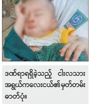
ဒဏ်ရာရရှိခဲ့သည့် ငါးလသား အရွယ်ကလေးငယ်၏ မှတ်တမ်း ဓာတ်ပုံ။