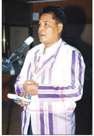
ဦးဇော်မင်းဦး

လျှပ်စစ်စွမ်းအားဝန်ကြီးဌာနမှ တာဝန်ရှိသူတစ်ဦးက လျှပ်စစ် စွမ်းအားဝန်ကြီးဌာန၊ တိုင်းဒေသကြီး/ပြည်နယ်၊ ရန်ကုန်၊ မန္တလေး သုံးခုသည် ဓာတ်အားရောင်းချခြင်း၊ ပြန်လည်ကောက်ခံခြင်းလုပ်ငန်း များကို လုပ်ပါကြောင်း၊ လစဉ် ၁ ရက်နေ့တွင် မိတာဘေလ်ဖတ်ခြင်း၊ မိတာဘေလ်ထုတ်ခြင်း၊ မိတာခကောက်ခံခြင်းလုပ်ငန်းများကို လုပ်ပါ ကြောင်း၊ သို့သော်လည်း အခြေအနေအရပ်ရပ်ကြောင့် ငွေကောက်ခံ သည့် နေရာတွင် နှောင့်နှေးရသည်များရှိပါကြောင်း၊ မိမိတို့အနေဖြင့် ကြိုးစားကောက်ခံသော်လည်း လစဉ်အကြွေးကျန်သည်များရှိပါ ကြောင်း၊ ကျန်ခဲ့သည့်လများအတွက် စီမံချက်များဖြင့် ကောက်ခံသည့် လုပ်ငန်းများ ဆက်လုပ်ပါကြောင်း၊ အကြွေးကျန်သည့် ကိစ္စများတွင် အကြောင်းအမျိုးမျိုးကြောင့် မဆောင်နိုင်သည့် ကိစ္စများလည်းရှိပါ ကြောင်း၊ ကျန်ခဲ့သည့် အကြွေးကျန်များကို မိမိတို့ထံ လာဆောင်သည့် အခါတွင် ပြန်လည်စိစစ်ပြီး တိတိကျကျလုပ်ဆောင်နိုင်ရန်အတွက် ညွှန်ကြားချက်များလည်း ထုတ်ထားပါကြောင်း၊ တချို့နေရာများတွင် အနည်းငယ်လွဲနေနိုင်သည်များရှိပါက လိုအပ်သည့် နေရာများတွင် လိုအပ်သကဲ့သို့ ညွှန်ကြားချက်များထုတ်ပြီး ကူညီဆောင်ရွက်ပေး မည်ဖြစ်ကြောင်း၊ မီးသုံးစွဲသူများကလည်း မိတာခများကို ပုံမှန် ပေးဆောင်ပါက ပြည်သူများပို၍ မီးမှန်မှန်ကန်ကန် ရသွားမည်ဟု ဖြည့်စွက်ဖြေကြားသည်။