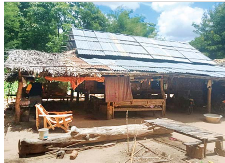
ဖြစ်စဉ်ဖြစ်ပွားခဲ့သည့် နေအိမ် မှတ်တမ်းဓာတ်ပုံ။