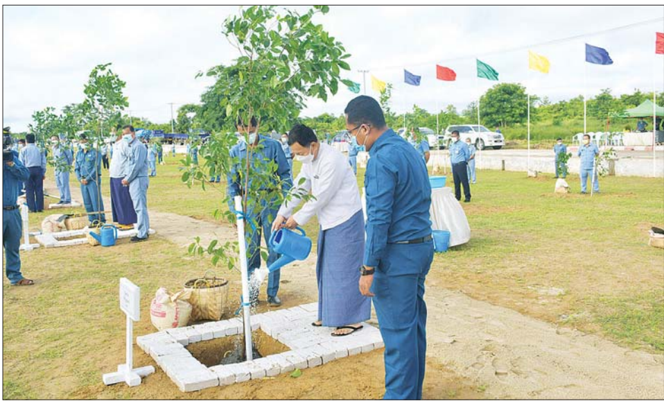
နေပြည်တော် ကောင်စီဥက္ကဋ္ဌ နေပြည်တော် စည်ပင်သာယာရေးကော်မတီဥက္ကဋ္ဌ မြို့တော်ဝန် ဒေါက်တာ မောင်မောင်နိုင် မိုးရာသီသစ်ပင်စိုက်ပျိုးပွဲအထိမ်းအမှတ် သစ်ပင်စိုက်ပျိုးပေးစဉ်။

ပြည်ထောင်စုနယ်မြေနေပြည်တော် စီမံခန့်ခွဲရေးနှင့် သဘာဝ ပတ်ဝန်းကျင် ထိန်းသိမ်းရေးတို့ အတွက် နေပြည်တော်စည်ပင် သာယာရေးကော်မတီ၏ ၂၀၂၂ ခုနှစ် မိုးရာသီသစ်ပင်စိုက်ပျိုးပွဲ ကို ယနေ့နံနက်ပိုင်းက ဒက္ခိဏ သီရိမြို့နယ် မြစ်မခလမ်း သံတမန်ဇုန်အတွင်း မြေနေရာ၌ ကျင်းပသည်။