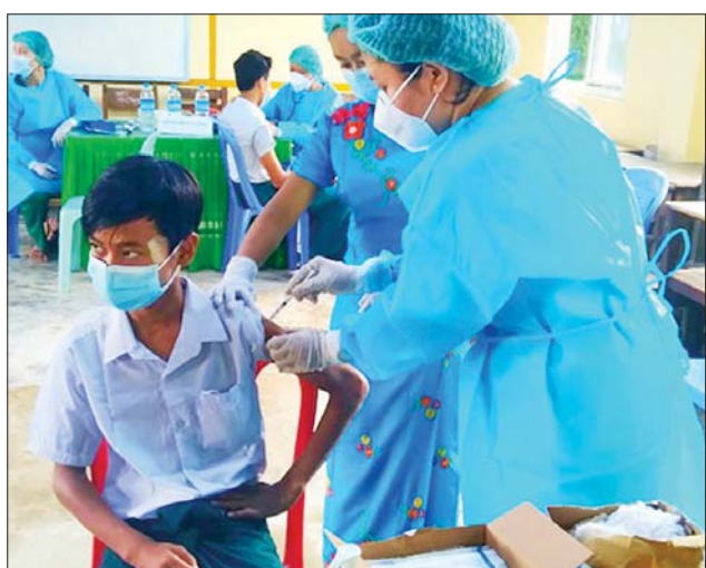
တပ်မတော်မှ ဆေးအဖွဲ့များက ပြည်သူ့ဆေးရုံများမှ ဆရာဝန်များ၊ သက်ဆိုင်ရာ ကျန်းမာရေးဝန်ထမ်း များ၊ စေတနာ့ဝန်ထမ်းများနှင့် ပူးပေါင်း၍ ကိုဗစ်- ၁၉ ရောဂါ ကာကွယ်ဆေးထိုးနှံပေးသည်။ ယင်းသို့ ဆောင်ရွက်ပေးနေမှု များကို သက်ဆိုင်ရာ တိုင်းဒေသ ကြီးနှင့် ပြည်နယ်များမှ တာဝန်ရှိ သူများက သွားရောက်ကြည့်ရှု အားပေးပြီး လိုအပ်သည်များ ညှိနှိုင်း ဆောင်ရွက်ပေးကြ ကြောင်း သတင်းရရှိသည်။ သတင်းစဉ်

သက်ဆိုင်ရာ ကျန်းမာရေးဝန်ထမ်း များ၊ စေတနာ့ဝန်ထမ်းများနှင့် ပူးပေါင်း၍ ကိုဗစ်-၁၉ ရောဂါ ကာကွယ်ဆေးထိုးနှံပေးသည်။ ထို့အတူ ကျောင်းသား ကျောင်းသူများကိုလည်း ကိုဗစ်- ၁၉ ရောဂါ ကာကွယ်ဆေးများ ထိုးနှံပေးလျက်ရှိရာ ယနေ့တွင် ရှမ်းပြည်နယ် (အရှေ့ပိုင်း) တာချီလိတ်မြို့၌ ကျောင်းသား ကျောင်းသူ ၂၀၀၀၊ ဧရာဝတီတိုင်း ဒေသကြီးအတွင်းရှိ မြို့နယ် ၂၆ မြို့နယ်တို့၌ ကျောင်းသား ကျောင်းသူ ၁၀၉၁၃ ဦး၊ ရခိုင် ပြည်နယ်နှင့် ချင်းပြည်နယ် အတွင်းရှိ မြို့နယ် ကိုးမြို့နယ်တို့၌ ကျောင်းသား ကျောင်းသူ ၁၂၅၆၃ ဦးနှင့် ပဲခူးတိုင်းဒေသကြီး ထန်းတပင်မြို့နယ်၌ ကျောင်းသား ကျောင်းသူ ၆၅၃ ဦးတို့ကို