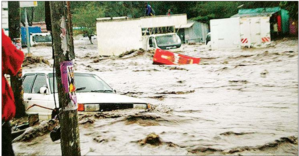
အာသံပြည်နယ်တွင် ရေကြီးမှုကြောင့် မော်တော်ယာဉ်များ နစ်မြုပ်နေသည်ကို တွေ့ရစဉ်။

အာသံပြည်နယ်၏ ခရိုင် ၃၂ ခုတွင် ရေဘေးဒုက္ခ ခံစားရလျက်ရှိသည်။ ကျေးရွာပေါင်း ၅၀၀၀ နီးပါး ရေလွှမ်းနှစ်မြုပ်ပြီး ကောက်ပဲသီးနှံဟက်တာပေါင်း ၉၉၀၂၆ ဟက်တာ ထိခိုက်ပျက်စီးခဲ့ကြောင်း အရာရှိများက ပြောသည်။ ဒေသအာဏာပိုင်များသည် ရေလွှမ်းမှုဖြစ်ပွား ရာဒေသများတွင် ရေဘေးကယ်ဆယ်ရေးစခန်းပေါင်း ၁၈၇၁ ခုအထိ တည်ဆောက်ပေးခဲ့သည်။ အဆိုပါ စခန်းများတွင် ကလေးငယ် ၇၃၉၇၈ ဦးအပါအဝင် လူပေါင်း ၂၇၁၁၂၅ ဦး ခိုလှုံလျက်ရှိသည်။ ကယ်ဆယ် ရေးလုပ်ငန်းများကိုလည်း အရှိန်မြှင့်လုပ်ဆောင်လျက် ရှိကြောင်းနှင့် ကယ်ဆယ်ရေးပစ္စည်းများ ထောက်ပံ့ ရန် ရဟတ်ယာဉ်များကို အသုံးပြုလျက်ရှိသည်။ မိုးရာသီ ညှိ ရေကြီးမှုများသည် အာသံပြည်နယ်တွင် ပုံမှန်ဖြစ်ပွားလေ့ရှိသည်။ ဆင်ဟွာ