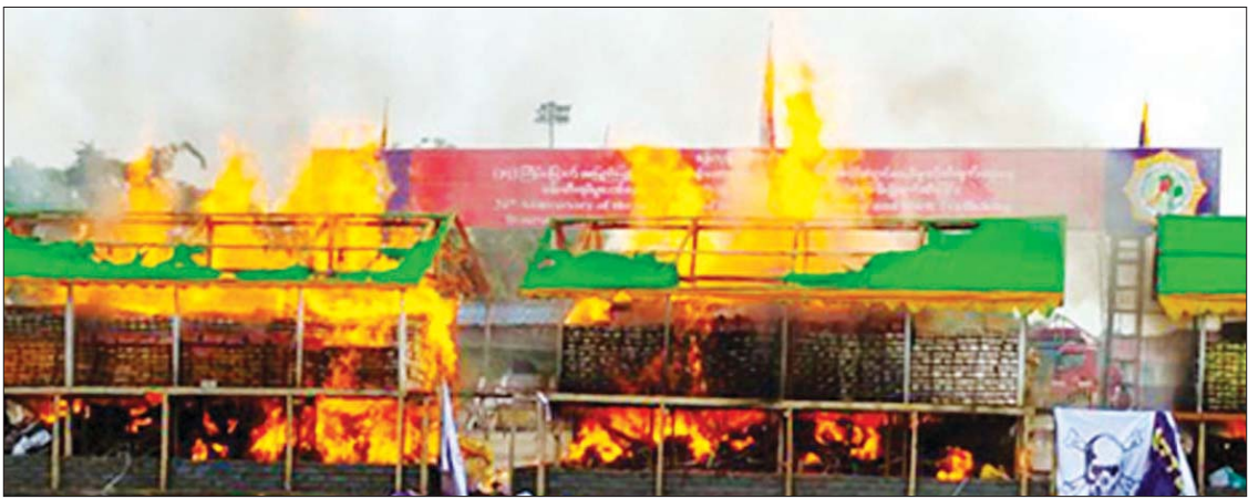
ဖမ်းဆီးရမိသော မူးယစ်ဆေးဝါးများကို ၂၀၂၁ ခုနှစ် ဇွန် ၂၆ ရက်က အပြည်ပြည်ဆိုင်ရာ မူးယစ်ဆေးဝါးအလွဲသုံးမှုနှင့် တရားမဝင်ရောင်းဝယ်မှုတိုက်ဖျက်ရေးနေ့ အခမ်းအနား၌ မီးရှို့ဖျက်ဆီးစဉ်။

သုံးနိုင်ငံ အထူးစစ်ဆင်ရေးများ ရွှေတြိဂံဒေသအတွင်းသို့ မူးယစ် ဆေးဝါးချက်လုပ်ရာတွင် အသုံးပြုသည့် ဓာတုပစ္စည်းများ မဝင်ရောက်စေရေးနှင့် ဒေသအတွင်းမှ မူးယစ်ဆေးဝါးများ ဒေသအပြင်သို့ မရောက်ရှိစေရေး၊ လာအို-မြန်မာ-ထိုင်း သုံးနိုင်ငံအကြား တစ်ချိန်တည်းတစ်ပြိုင်တည်း မိမိနိုင်ငံ အလိုက် ပူးပေါင်းဆောင်ရွက်သည့် ဘေးကင်းလုံခြုံသော မဲခေါင်စစ်ဆင်ရေး စီမံချက်တွင် မြန်မာနိုင်ငံ တာချီလိတ် ခရိုင်နှင့် မိုင်းဆတ်ခရိုင်တို့ ပါဝင်ရာ မြန်မာနိုင်ငံအနေဖြင့် ၂၀၂၁ ခုနှစ် ဖေဖော် ဝါရီလ ၁ ရက်မှ ဧပြီလ ၃၀ ရက်နေ့အထိ ရှမ်းပြည်နယ်အတွင်း ရှမ်းရိုးမ (၄) အထူး စစ်ဆင်ရေးဖြင့် သုံးနိုင်ငံစစ်ဆင်ရေးကို ဆောင်ရွက်ခဲ့ရာ အမှုပေါင်း ၃၁၉ မှု၊