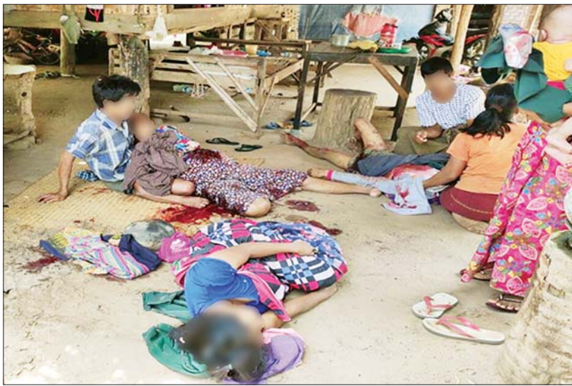
ဒေသန္တရလုပ်ဗုံးပေါက်ကွဲမှုကြောင့် ဒဏ်ရာရရှိ/သေဆုံးခဲ့သည့် မြိုင်မြို့နယ် ထန်းဘူးတော ကျေးရွာနေ ရွာသူ ရွာသား အမျိုးသား သုံးဦးနှင့် အမျိုးသမီး သုံးဦး၏ မှတ်တမ်းဓာတ်ပုံ။

နေပြည်တော် ဇွန် ၂၃ NUG | CRPH အမည်ခံအကြမ်း ဖက်အဖွဲ့များနှင့် ၎င်းတို့၏ လက်အောက်ခံ PDF အမည်ခံ အကြမ်းဖက်သမားများသည် ၎င်း တို့၏ အစွန်းရောက်နိုင်ငံရေး အယူဝါဒများကို အခြေခံ၍ ဒေသ အချို့၌ အစိုးရရုံး အဆောက်အအုံ များ၊ ပြည်သူပိုင်အဆောက်အအုံ၊ လမ်းတံတားများ၊ ဘုရားကျောင်း ကန်များ၊ မြို့နယ်၊ ရပ်ကွက်၊ ကျေးရွာများအား စီးရီးယွယ်ဆီး ခြင်း၊ ဗုံးခွဲတိုက်ခိုက်ခြင်းများနှင့် စေတီပုထိုးများ၊ ကျေးရွာနှင့် ပြည်သူလူထုအား အကာအကွယ် ယူ၍ လုံခြုံရေးတပ်ဖွဲ့များအား စာမျက်နှာ ၁၂ ကော်လံ ၁ ဩ