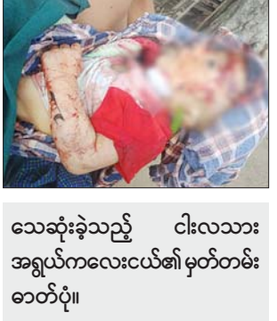
သေဆုံးခဲ့သည့် ငါးလသား အရွယ်ကလေးငယ်၏ မှတ်တမ်း ဓာတ်ပုံ။

※ ကျောဖုံးမှ GFA အသင်းနှင့် ရတနာပုံအသင်းတို့ ယှဉ်ပြိုင်ကစားမည်ဖြစ်သည်။ ပွဲစဉ်အားလုံးကို ညနေ ၃ နာရီခွဲတွင် စတင်ကျင်းပမည်ဖြစ်သည်။ MNL အမှတ်ပေးပြိုင်ပွဲကို တစ်ပတ်လျှင် ငါးပွဲနှုန်းဖြင့် ကျင်းပမည်ဖြစ်ပြီး စနေ၊ တနင်္ဂနွေ၊ တနင်္လာ၊ ဗုဒ္ဓဟူးနှင့် ကြာသပတေးနေ့တို့တွင် ပြုလုပ် မည်ဖြစ်သည်။ အဖွင့်ပွဲကစားမည့် မြဝတီအသင်းမှာ MNL သို့ တန်းပြန်တက်လာခြင်းဖြစ်ပြီး အအောင်မြင်ဆုံးအသင်း ဖြစ်သည့် ရန်ကုန်အသင်းနှင့် စတင်ကစားရခြင်းဖြစ်သည်။ ပြိုင်ပွဲဝင်မည့် ကလပ်အသင်းအားလုံးသည် ရာသီသစ်အတွက် ပြင်ဆင်မှုများစွာပြုလုပ်ထားပြီး အသင်းအများစုမှာမူ ပြည်တွင်း ကစားသမားများဖြင့်သာ ယှဉ်ပြိုင်မည်ဖြစ်သည်။ လက်ရွေးစင်အဆင့် ကစားသမားအများစုမှာ ပြည်ပထွက်ကစားနေခြင်းနှင့် ပြည်ပကလပ် များတွင် ကစားခွင့်ရရန် ကြိုးပမ်းနေခြင်းတို့ကြောင့် လာမည့် MNL ပြိုင်ပွဲတွင် မျက်နှာသစ်ကစားသမားများ၊ လူငယ်ကစားသမား များစွာ တွေ့မြင်ရမည်ဖြစ်သည်။ ထို့ကြောင့် လာမည့် MNL ပြိုင်ပွဲမှာ ပြည်တွင်းကစားသမားများ အားပြိုင်မည့်ပြိုင်ပွဲကို တွေ့မြင်ရမည် ဖြစ်သည်။ ရဲရင့်လွင်