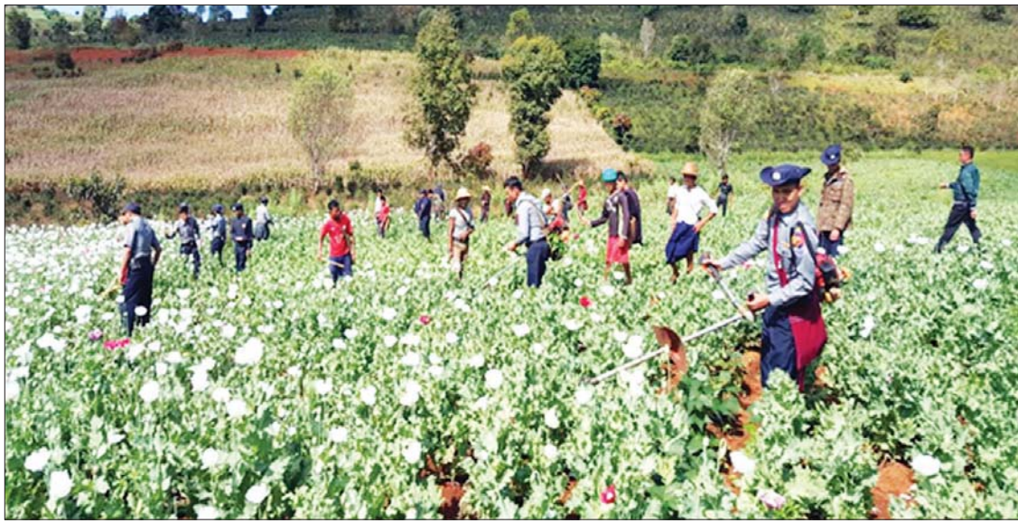
ဘီနားခင်းဖျက်ဆီးမှု မှတ်တမ်းဓာတ်ပုံ။

မူးယစ်ဆေးဝါးတွင် ဘီနားကို ကမ္ဘာ့နိုင်ငံများ လက်တွဲ၍ ပူးပေါင်းတားဆီးကာကွယ်နေစဉ်စိတ်ကြွရှားသွပ်ဆေးပြားသည် လူတန်းစားမရွေးသုံးစွဲနိုင်သော အဆင့်သို့ ထုတ်လုပ်ဖြန့်ချိလာသောကြောင့် အကျိုးဆက်အနေဖြင့် ဖွံ့ဖြိုးပြီး နိုင်ငံများတွင် တားဆီးနှိမ်နင်းရေး လုပ်ငန်းများသည် အခက်အခဲအတားအဆီးများစွာ ရင်ဆိုင်လာရသည့်နည်းတူ ဖွံ့ဖြိုးဆဲနိုင်ငံများ အနေဖြင့်လည်း တစ်ပူပေါ် နှစ်ပူဆင့်သည့်ပမာ မူးယစ်ဆေးဝါးအန္တရာယ်ကို အမျိုးသားရေးအသွင်တစ်ရပ်အနေဖြင့် တားဆီးကာကွယ်နှိမ်နင်းနေရသည်။