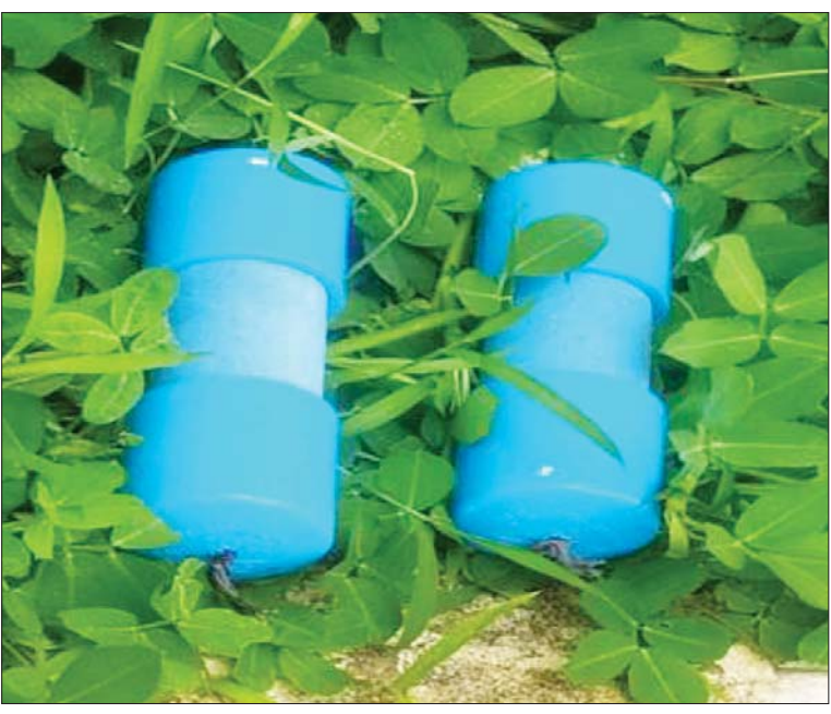
မွန်ပြည်နယ် မော်လမြိုင်မြို့နယ် မြို့နယ်ပညာရေးမှူးရုံးအတွင်း၌ တွေ့ရှိရသော လက်လုပ်မိုင်း နှစ်လုံး။

နေပြည်တော် ဇွန် ၂၂ နိုင်ငံတော်အစိုးရအနေဖြင့် နိုင်ငံ၏ အနာဂတ်ဖြစ်သည့် မျိုးဆက်သစ် ရင်သွေး ငယ်များ၏ ပညာရေးတွင် နောက်ကျ ကျန်ရစ်မှုမဖြစ်ပေါ်စေရေးအတွက် ပညာ သင်ကြားနိုင်မှု အခွင့်အလမ်းကို ပြည့်ဝ စွာ အသုံးပြုနိုင်စေရန် အခြေခံပညာ ကျောင်းများကို ဇွန် ၂ ရက်တွင် စတင်ဖွင့်လှစ် သင်ကြားပေးလျက်ရှိရာ NUG နှင့် ၎င်း၏လက်အောက်ခံ နိုင်ငံရေး အစွန်းရောက် အကြမ်းဖက်များက အနာဂတ်ရင်သွေးငယ်များ၏ ပညာ သင်ကြားသင်ယူခွင့် အခွင့်အလမ်းများ ပျက်ပြား၍ ပညာမဲ့လူတန်းစားများ ဖြစ်ပေါ်လာစေရန်နှင့် ကျောင်းသား ကျောင်းသူ၊ ဆရာ၊ မိဘများကို