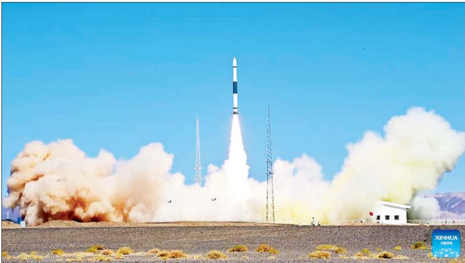
တီယန်စင်း-၁ ဂြိုဟ်တု လွှတ်တင်နေမှုကို ဇွန် ၂၂ ရက်က တွေ့ရစဉ်။

အဆိုပါ ဂြိုဟ်တုကို အာကာသပတ်ဝန်းကျင် စုံစမ်းထောက်လှမ်းခြင်း ကဲ့သို့သော