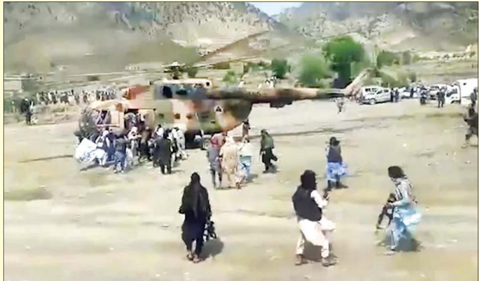
ငလျင်လှုပ်မှုဖြစ်ပွားသည့် ပျမ်တီကာပြည်နယ် ဂါယန်ခရိုင်မှ ထိခိုက်ဒဏ်ရာရရှိသူများကို ရဟတ်ယာဉ်ဖြင့် ဘေးလွတ်ရာသို့ ရွှေ့ပြောင်းနေမှုကို တွေ့ရစဉ်။

အာဖဂန်နစ္စတန်နိုင်ငံ ပျမ်တီကာပြည်နယ်နှင့် ချေစ်ပြည်နယ်တို့တွင် ဇွန် ၂၂ ရက်အစောပိုင်းက ပြင်းထန်သော ငလျင်လှုပ်မှုဖြစ်ပွားသောကြောင့် လူ ၁၀၀၀ ကျော် သေဆုံးပြီး ၁၅၀၀ ထက်မနည်း ထိခိုက်ဒဏ်ရာရရှိကြောင်း အင်န်အိတ်ချီကေ သတင်းတစ်ရပ်တွင် ဖော်ပြသည်။