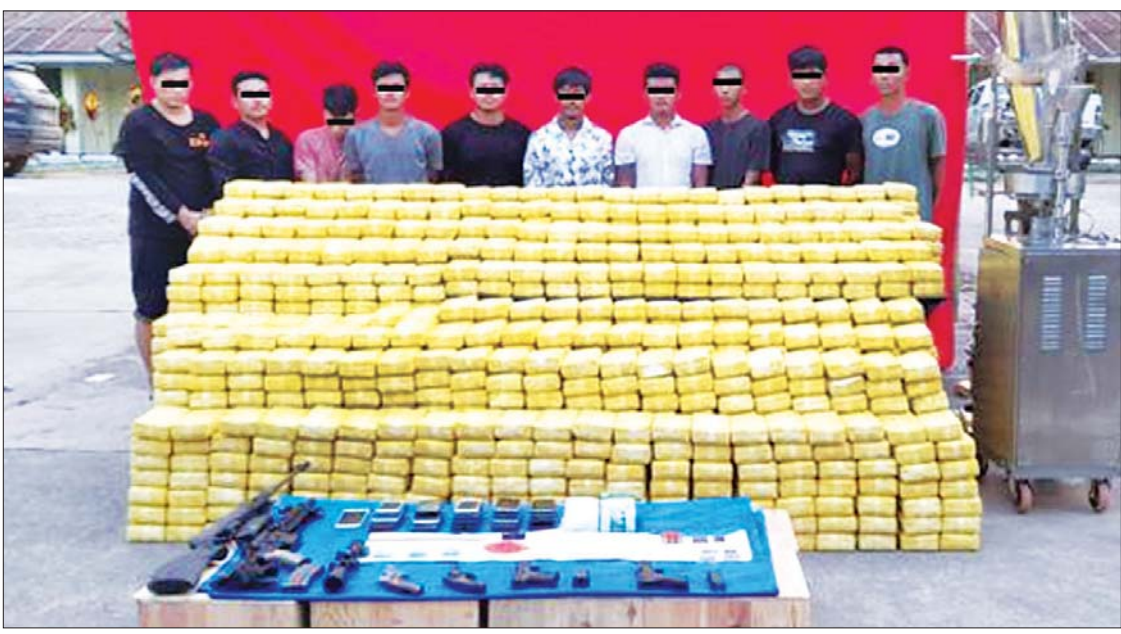
၂၀၂၂ ခုနှစ် ဧပြီ ၂၄ ရက်က တာချီလိတ်မြို့၊ ဝိန်းကျောက်ရပ်ကွက်၌ ဖမ်းမိသော ကျပ် ငါးဘီလီယံကျော်တန်ဖိုးရှိ မူးယစ်ဆေးဝါး များ၊ လက်နက်များနှင့် တရားခံများ။

ဗြိတိသျှအစိုးရက ဘိန်းသယ်ယူခြင်း၊ ရောင်းချခြင်းကို ကိုယ်တိုင်ပြုလုပ်ပြီး