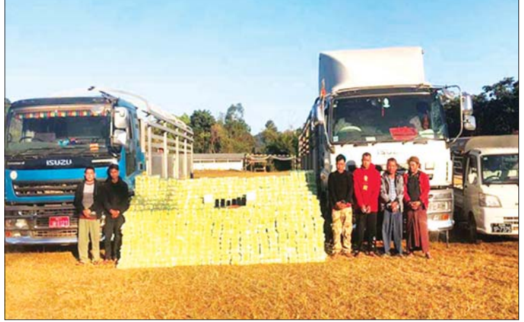
၂၀၂၂ ခုနှစ် ဇန်နဝါရီလက လွိုင်လင်မြို့နယ်အတွင်း ၁၂ ဘီးယာဉ်နှစ်စီးပေါ်မှ ဖမ်းမိသော ကျပ် ၁၇ ဘီလီယံကျော် တန်ဖိုးရှိ မူးယစ်ဆေးဝါးများ။