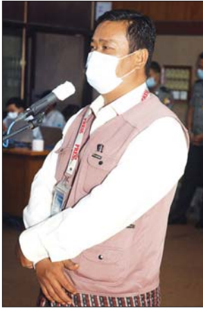
ဦးဝင်းဦး

ဗိုလ်ချုပ်ဇော်မင်းထွန်းက ပြည်သူ့စစ်အဖွဲ့ ဖွဲ့စည်းထားသည့် ကျေးရွာများရှိကြောင်း၊ ပြည်သူ့စစ်အဖွဲ့ ဖွဲ့စည်းရာတွင် ၁၉၅၉ ခုနှစ်၊ ဥပဒေအတိုင်း ဆောင်ရွက်ခြင်းဖြစ်ကြောင်း၊ ပြည်သူ့စစ်အဖွဲ့ဖွဲ့စည်းရန် နယ်မြေအေးချမ်းသာယာမှုမရှိသည့် ဒေသများ၊ နယ်မြေအခက်အခဲ ဖြစ်သည့် ဒေသများရှိ ပြည်သူလူထုမှ သက်ဆိုင်ရာကို လျှောက်ထားရ မည်ဖြစ်ကြောင်း၊ ယင်းသို့လျှောက်ထားမှုများအပေါ် အဆင့်ဆင့် ဆုံး ဖြတ်၍ ဖွဲ့စည်းရကြောင်း၊ ပြည်သူ့စစ်ဖွဲ့စည်းသည့်နေရာတွင်လည်း လုပ်ချင်သလို လုပ်၊ ဖွဲ့ချင်သလိုဖွဲ့ ဖွဲ့စည်း၍မရကြောင်း၊ ပင်မအဖွဲ့၊ အရန်အဖွဲ့ ဟူ၍ ဖွဲ့ စည်းရကြောင်း၊ လက်နက်တပ်ဆင်ရာတွင်လည်း လိုအပ်သည့် လက်နက်သာ တပ်ဆင်ရကြောင်း၊ ထို့ပြင် လိုအပ်သည့် လုံခြုံရေးဆိုင်ရာသင်ကြားမှုများ ဆောင်ရွက်ရကြောင်း၊ စည်းမျဉ်း၊ စည်းကမ်းများသည်လည်း လက်နက်ကိုင်တပ်ဖွဲ့များအတိုင်း လိုက်နာ ဆောင်ရွက်ရကြောင်း၊ ပြည်သူ့စစ်ဖွဲ့စည်းရာတွင် စနစ်တကျသင်ကြား ပြီးမှ ဆောင်ရွက်ရကြောင်း၊ သင်ကြားရာတွင် သေနတ်ပစ်ခတ်တတ်ရုံ သင်ကြားပေးခြင်း မဟုတ်ဘဲ ၎င်းတို့ လိုက်နာရမည့် စည်းမျဉ်း၊ စည်းကမ်းများကို လိုက်နာရကြောင်း၊ တစ်နိုင်လုံးတွင် ဖွဲ့စည်းပေး ထားသည့် ပြည်သူ့စစ်အားလုံးက လိုက်နာကြရကြောင်း။