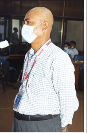
ဦးသိန်းဝင်းဦး

ပြည်သူ့စစ်အဖွဲ့တစ်ဖွဲ့ ဖွဲ့စည်းပေးပြီးလျှင် ယင်းပြည်သူ့စစ်ဖွဲ့စည်း ထားသည့် ကျေးရွာကို PDF များအနေဖြင့် ဝိုင်းဝန်းတိုက်ခိုက်မှုမျိုး တွေ့ရကြောင်း၊ ထို့ကြောင့် ပြည်သူ့စစ်အဖွဲ့များအတွက် လုံလောက် သော လက်နက်/ ခဲယမ်းများ ဖြည့်ဆည်းပေးရန် တောင်းဆိုမှုများရှိ ကြောင်း၊ ယင်းတောင်းဆိုမှုများကို စနစ်တကျ လုပ်ဆောင်ပေးလျက်ရှိ ကြောင်း၊ တိုင်းဒေသကြီးအစိုးရအဖွဲ့အနေဖြင့်လည်း ယင်းကိစ္စနှင့် ပတ်သက်၍ လုပ်ဆောင်ပေးနေမှုများရှိသော်လည်း တိုင်းဒေသကြီး အစိုးရအဖွဲ့ တစ်ဖွဲ့တည်းနှင့်လည်း လုံလောက်မှုမရှိသည်ကို တွေ့ရှိရ ကြောင်း၊ တိုင်းဒေသကြီး အစိုးရအဖွဲ့အနေဖြင့် ပြည်သူ့စစ်ဖွဲ့စည်းထား သည့် ကျေးရွာများသာမက မဖွဲ့ထားသည့် ကျေးရွာများအတွက်ပါ တာဝန်ရှိကြောင်း၊ ထောက်ပံ့ပံ့ပိုးမှုများ လုပ်ဆောင်နေသည်ကိုတွေ့ရ ကြောင်း၊ ဆောင်ရွက်ရသည့်ကိစ္စရပ်များ များပြားသည့်အတွက် လစ်လပ်မှုများလည်း ရှိနိုင်ကြောင်း၊ မိမိပြောလိုသည်မှာ နယ်မြေ ဒေသအသီးသီးရှိ ဒေသခံပြည်သူများအနေဖြင့် မိမိရပ်ရွာလုံခြုံရေး၊ မိမိ သား၊ သမီး လုံခြုံရေးအတွက် ပြည်သူ့စစ်ဖွဲ့စည်းပြီး လုံခြုံရေးအရ မြန်မာနိုင်ငံအရပ်ရပ်တွင်ရှိသည့် ပြည်သူ့စစ်အဖွဲ့ဝင်များ၊ အထောက် အကူပြုအဖွဲ့များနှင့် ပတ်သက်ပြီး တပ်မတော်အနေနှင့်ရော နိုင်ငံတော်အနေဖြင့်ပါ ပူးပေါင်းဆောင်ရွက်မှုများအတွက် အသိအမှတ် ပြု ကျေးဇူးတင်ရှိသည်ကို ပြောလိုကြောင်း။