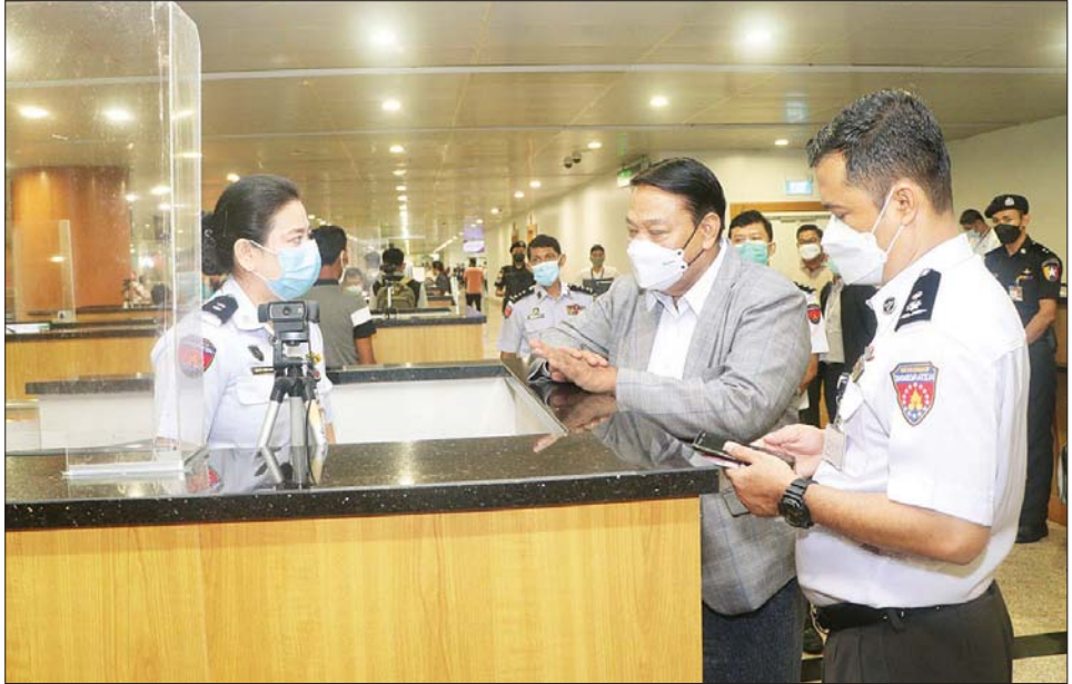
ပြည်ထောင်စုဝန်ကြီး ဦးခင်ရီ ရန်ကုန်အပြည်ပြည်ဆိုင်ရာလေဆိပ် လူဝင်မှုကြီးကြပ်ရေးကောင်တာများ၌ လူဝင်မှုစစ်ဆေးရေးလုပ်ငန်းများ ဆောင်ရွက်နေမှုများကို ကြည့်ရှုစစ်ဆေးစဉ်။

လူဝင်မှုကြီးကြပ်ရေးနှင့် ပြည်သူ့အင်အားဝန်ကြီးဌာန ပြည်ထောင်စုဝန်ကြီး ဦးခင်ရီသည် အမြဲတမ်း အတွင်းဝန် ဦးအောင်ကျော်စိုး၊ တာဝန်ရှိသူများနှင့်အတူ ယနေ့ နံနက် ၈ နာရီတွင် ရန်ကုန်အပြည်ပြည်ဆိုင်ရာလေဆိပ်သို့ ရောက်ရှိပြီး Terminal-1 ရှိ Mingalar Sky CIP ဧည့်ခန်းမ၌ ရန်ကုန်အပြည်ပြည်ဆိုင်ရာလေဆိပ်နှင့် ရန်ကုန်အပြည်ပြည်ဆိုင်ရာဆိပ်ကမ်းတို့မှ လူဝင်မှုကြီးကြပ်ရေးဆိုင်ရာ လုပ်ငန်းတာဝန်ခံများ အား တွေ့ဆုံသည်။