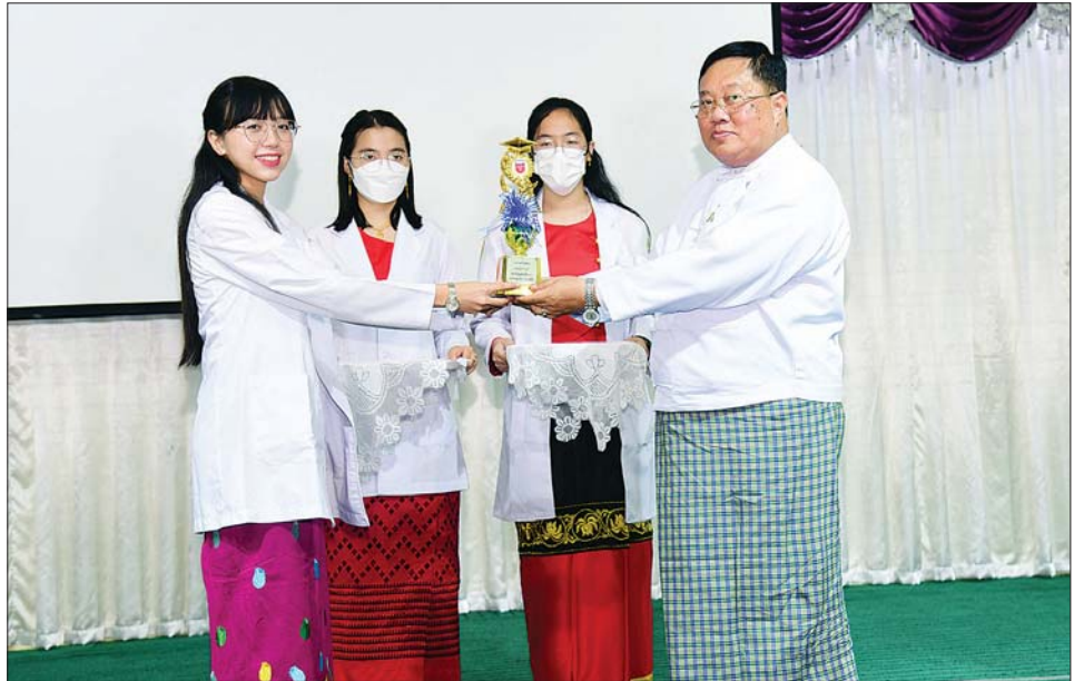
ရှင်သော ကျောင်းသား ကျောင်းသူများအား ပြည်နယ် ပေးအပ်ခဲ့သည်။ (အပေါ်ပုံ) မောင်မောင်သန်း(တောင်ကြီး) ဝန်ကြီးချုပ်က ဂုဏ်ပြုဆုငွေကျပ် တစ်သိန်းစီ ချီးမြှင့်

ထို့နောက် ရှမ်းပြည်နယ်အစိုးရအဖွဲ့မှ ပညာသင်ထောက်ပံ့ငွေကျပ် ၁၀ သိန်းကို ပြည်နယ်ဝန်ကြီးချုပ် ဒေါက်တာကျော်ထွန်းက ပေးအပ်ရာ ဆေးတက္ကသိုလ် (တောင်ကြီး)ပါမောက္ခချုပ် ပါမောက္ခ ဒေါက်တာလှမြင့်ဝင်းက လက်ခံရယူပြီး ပညာရည်ချွန်ဆု