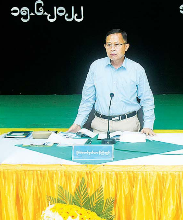
နိုင်ငံတော်စီမံအုပ်ချုပ်ရေးကောင်စီ ဒုတိယဥက္ကဋ္ဌ ဒုတိယတပ်မတော်ကာကွယ်ရေးဦးစီးချုပ် ကာကွယ်ရေးဦးစီးချုပ်(ကြည်း) ဒုတိယဗိုလ်ချုပ်မှူးကြီး စိုးဝင်း အမ်းမြို့ရှိ မြို့နယ်စီမံအုပ်ချုပ်ရေးအဖွဲ့များ၊ မြို့နယ်အဆင့် ဌာနဆိုင်ရာဝန်ထမ်းများအား တွေ့ဆုံအမှာစကားပြောကြားစဉ်။

နေပြည်တော် ဇွန် ၁၅ နိုင်ငံတော်စီမံအုပ်ချုပ်ရေးကောင်စီ ဒုတိယဥက္ကဋ္ဌ ဒုတိယတပ်မတော်ကာကွယ်ရေးဦးစီးချုပ် ကာကွယ်ရေးဦးစီးချုပ်(ကြည်း) ဒုတိယဗိုလ်ချုပ်မှူးကြီး စိုးဝင်းသည် ယနေ့နံနက်ပိုင်းတွင် အမ်းမြို့ရှိ ရွှေအမ်းတောင်ခန်းမ၌ မြို့နယ်စီမံအုပ်ချုပ်ရေးအဖွဲ့များ၊ မြို့နယ်အဆင့် ဌာနဆိုင်ရာဝန်ထမ်းများအား တွေ့ဆုံအမှာစကားပြောကြားသည်။