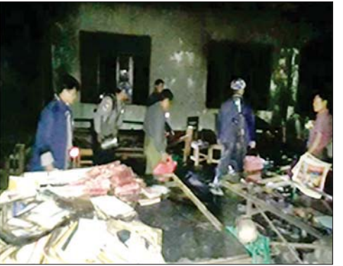
မကွေးတိုင်းဒေသကြီး ငဖဲမြို့နယ်ရှိ အခြေခံပညာအထက်တန်းကျောင်းအား အကြမ်းဖက်သမားများက မီးရှို့ဖျက်ဆီးမှု။

အခြေခံပညာအလယ်တန်းကျောင်းခွဲအား လည်းကောင်း၊ ယနေ့ နံနက် ၂ နာရီခန့်တွင် မကွေးတိုင်းဒေသကြီး ငဖဲမြို့နယ် ဂုတ်ကြီးကျေးရွာရှိ အခြေခံပညာ အထက်တန်းကျောင်းအား လည်းကောင်း၊ နံနက် ၃ နာရီ ၁၀ မိနစ်ခန့်တွင် ကချင်ပြည်နယ် မြစ်ကြီးနားမြို့နယ် မန်ခိန်ရပ်ကွက် အခြေခံပညာ အထက်တန်းကျောင်းရှိ “ရွှေနဒီ” ကျောင်းဆောင်ဟောင်းအား လည်းကောင်း PDF အမည်ခံအကြမ်းဖက်သမားများက မီးပုလင်းများဖြင့် ပစ်ခတ်ခြင်း၊ မီးရှို့ဖျက်ဆီးခြင်း စသည့်အကြမ်းဖက်လုပ်ရပ်များကို လုပ်ဆောင်ကြရာ မီးလောင်မှုများကြောင့် လုံခြုံရေးတပ်ဖွဲ့ဝင်များ၊ မီးသတ်တပ်ဖွဲ့ဝင်များနှင့် ဒေသခံပြည်သူများက ဝိုင်းဝန်းငြိမ်းသတ်ခဲ့ရသည်။ မီးလောင်မှုများကြောင့် ကျောင်းဆောင်များအတွင်းရှိ စာရွက်စာတမ်း၊ စာရေးခုံများ၊ သင်ထောက်ကူပစ္စည်းများနှင့် ဗီဒီယိုများ မီးလောင်ပျက်စီးဆုံးရှုံးခဲ့ပြီး အုတ်ခဲ၊ ပျဉ်ထောင်၊ သွပ်မိုး၊ ပျဉ်ခင်း၊ စာသင်ခန်း သုံးခန်းတွဲ နှစ်ထပ်ကျောင်းဆောင် တစ်လုံး မီးလောင်ပျက်စီးဆုံးရှုံးခဲ့ကြောင်း သိရသည်။ ဖြစ်စဉ်တွင် ပါဝင်ပတ်သက်သူများအား ဖော်ထုတ်ဖမ်းဆီး၍ ဥပဒေနှင့်အညီ ထိရောက်စွာအရေးယူနိုင်ရေး လုံခြုံရေးတပ်ဖွဲ့ဝင်များက စုံစမ်းဖော်ထုတ်လျက်ရှိကြောင်းနှင့် တိုင်းရင်းသားပြည်သူလူထု တစ်ရပ်လုံးအနေဖြင့်လည်း ယခုကဲ့သို့ ယုတ်မာရိုင်းစိုင်းသည့်လုပ်ရပ်ကို ကျူးလွန်ခဲ့သည့် ကျူးလွန်ရန် အားပေးလှုံ့ဆော်နေသည့် NUG၊ PDF အမည်ခံအကြမ်းဖက်အဖွဲ့များအပေါ် ဝိုင်းဝန်းဆန့်ကျင်ကြရန်နှင့် အကြမ်းဖက်အဖွဲ့များ၏ လှုပ်ရှားမှုသတင်းများ ရရှိပါက လုံခြုံရေးတပ်ဖွဲ့ဝင်များနှင့် သက်ဆိုင်ရာအုပ်ချုပ်ရေးအဖွဲ့များထံ သတင်းပို့ခြင်းဖြင့် ပြည်သူ့လုံခြုံရေး၊ အနာဂတ်လူငယ်များ၏ လုံခြုံရေးကို ဝိုင်းဝန်းကူညီပေးကြပါရန် မေတ္တာရပ်ခံတိုက်တွန်းထားကြောင်း သတင်းရရှိသည်။ သတင်းစဉ်