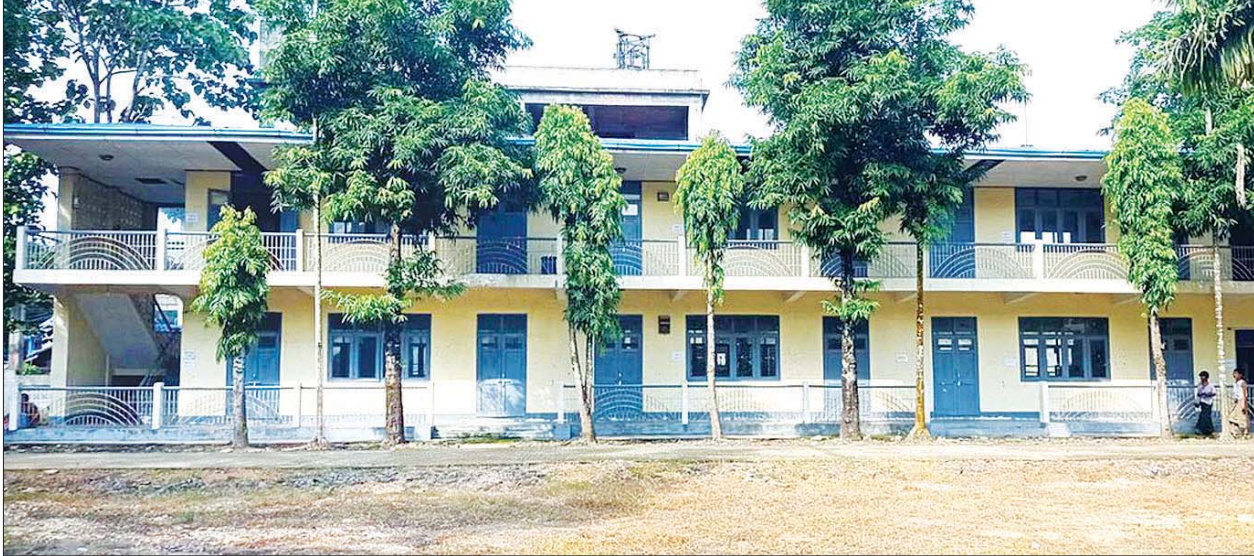
သမဝါယမစာရင်းရေး စာရင်းကိုင် သက်မွေးပညာသင်တန်းကျောင်း (ပုသိမ်)။