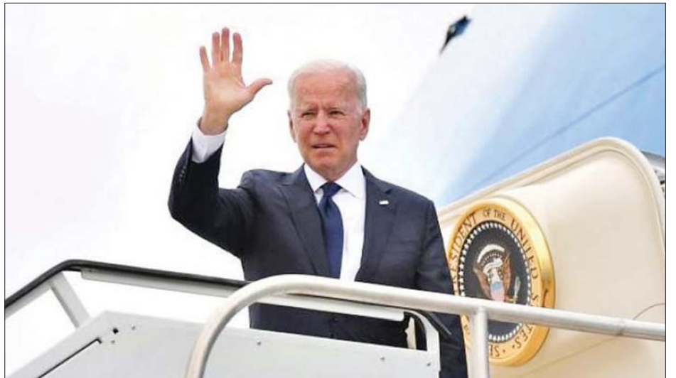
အမေရိကန်သမ္မတ ဂျိုးဘိုင်ဒင်

ဆော်ဒီအိမ်ရှေ့မင်းသား မိုဟာမက်ဘင်ဆယ်မန်သည် ၂၀၁၈ ခုနှစ်က တူရကီနိုင်ငံတွင် ဆော်ဒီဂျာနယ်လစ်တစ်ဦးကို သတ်ရန်အစီအစဉ် တစ်ခုအား အတည်ပြုခဲ့ကြောင်း ဘိုင်ဒင်အစိုးရက ပြီးခဲ့သည့်နှစ်တွင် အစီရင်ခံစာတစ်ခု ထုတ်ပြန်ခဲ့ပြီးနောက် အမေရိကန်နှင့် ဆော်ဒီအာရေဗျနိုင်ငံတို့၏ နှစ်နိုင်ငံဆက်ဆံရေး အေးစက်လာကြောင်း သိရသည်။ သို့သော်လည်း သမ္မတဘိုင်ဒင်သည် ဆော်ဒီအာရေဗျခရီးစဉ်တွင် အိမ်ရှေ့မင်းသား မိုဟာမက်ဘင်ဆယ်မန်နှင့် တွေ့ဆုံရန် စီစဉ်ထားကြောင်း သိရသည်။ အင်န်အိတ်ချ်ကေ