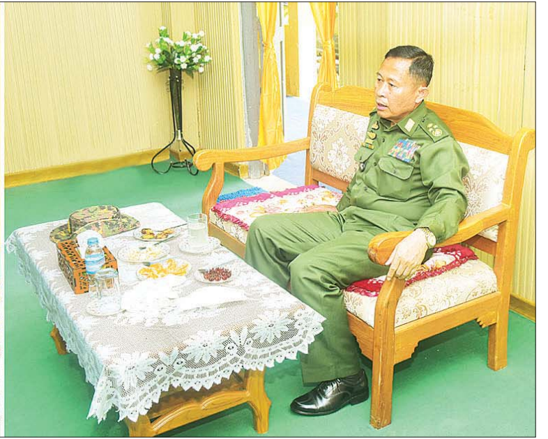
နိုင်ငံတော်စီမံအုပ်ချုပ်ရေးကောင်စီ ဒုတိယဥက္ကဋ္ဌ ဒုတိယတပ်မတော်ကာကွယ်ရေးဦးစီးချုပ် ကာကွယ်ရေးဦးစီးချုပ်(ကြည်း) ဒုတိယဗိုလ်ချုပ်မှူးကြီးစိုးဝင်း မင်းပြားတပ်နယ်မှ အရာရှိ၊ စစ်သည် မိသားစုဝင်များအား တွေ့ဆုံအမှာစကားပြောကြားစဉ်။