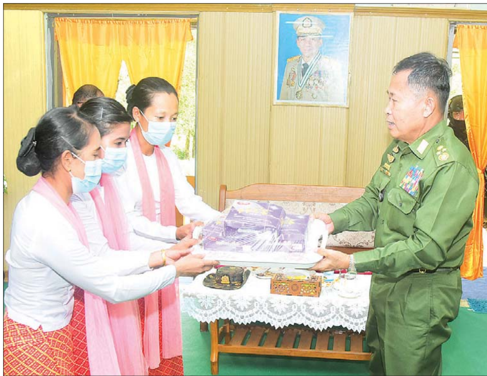
နိုင်ငံတော်စီမံအုပ်ချုပ်ရေးကောင်စီ ဒုတိယဥက္ကဋ္ဌ ဒုတိယတပ်မတော်ကာကွယ်ရေးဦးစီးချုပ် ကာကွယ်ရေးဦးစီးချုပ်(ကြည်း) ဒုတိယဗိုလ်ချုပ်မှူးကြီး စိုးဝင်း အရာရှိ၊ စစ်သည် မိသားစုများအတွက် စားသောက်ဖွယ်ရာပစ္စည်းများ ပေးအပ်စဉ်။

နေပြည်တော် ဇွန် ၁၅ နိုင်ငံတော်စီမံအုပ်ချုပ်ရေးကောင်စီ ဒုတိယဥက္ကဋ္ဌ ဒုတိယတပ်မတော်ကာကွယ်ရေးဦးစီးချုပ် ကာကွယ်ရေးဦးစီးချုပ်(ကြည်း) ဒုတိယဗိုလ်ချုပ်မှူးကြီး စိုးဝင်းသည် ကာကွယ်ရေးဦးစီးချုပ်မှူးမှ ဒုတိယဗိုလ်ချုပ်ကြီး ဖုန်းမြတ်၊ ကာကွယ်ရေးဦးစီးချုပ်မှူး (ကြည်း)ရေလေ) မှ တပ်မတော်အရာရှိကြီးများ၊ အနောက်ပိုင်းတိုင်းစစ်ဌာနချုပ် တိုင်းမှူး၊ ဗိုလ်ချုပ် ထင်လတ်ဦးနှင့် တာဝန်ရှိသူများလိုက်ပါ၍ ယနေ့မွန်းလွဲပိုင်းတွင် မင်းပြားတပ်နယ်မှ အရာရှိ၊ စစ်သည် မိသားစုဝင်များအား တပ်နယ်ရိပ်သာ၌ တွေ့ဆုံ၍ အမှာစကားပြောကြားသည်။