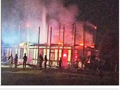
ကချင်ပြည်နယ် မြစ်ကြီးနားမြို့နယ်ရှိ အခြေခံပညာအထက်တန်းကျောင်းအား အကြမ်းဖက်သမားများက မီးရှို့ဖျက်ဆီးမှု။