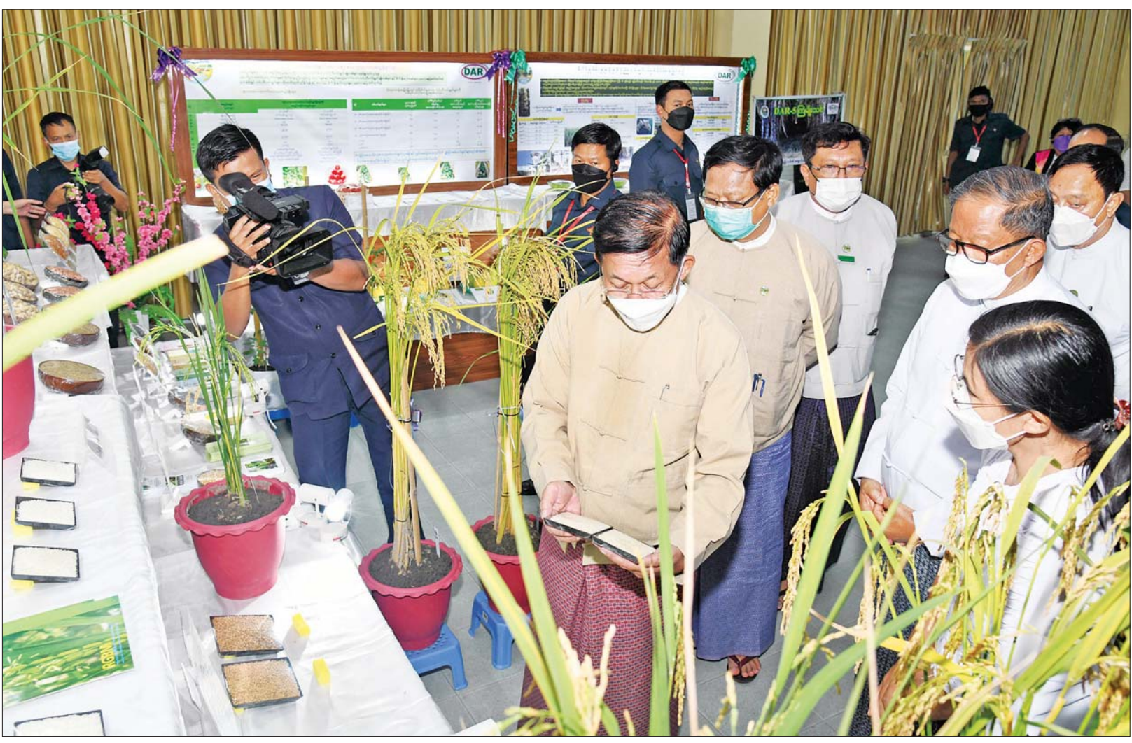
နိုင်ငံတော်စီမံအုပ်ချုပ်ရေးကောင်စီဥက္ကဋ္ဌ နိုင်ငံတော်ဝန်ကြီးချုပ် ဗိုလ်ချုပ်မှူးကြီး မင်းအောင်လှိုင်နှင့် တာဝန်ရှိသူများ စိုက်ပျိုးရေးသုတေသနဦးစီးဌာန ပြခန်းများအား လှည့်လည်ကြည့်ရှုစဉ်။

နေပြည်တော် ဇွန် ၁၄ နိုင်ငံတော် စီမံအုပ်ချုပ်ရေးကောင်စီဥက္ကဋ္ဌ နိုင်ငံတော်ဝန်ကြီးချုပ် ဗိုလ်ချုပ်မှူးကြီး မင်းအောင်လှိုင်သည် ယနေ့ မွန်းလွဲပိုင်းတွင် နေပြည်တော် ကောင်စီနယ်မြေ ဝေယျာသီရိမြို့နယ်ရှိ စိုက်ပျိုးရေးသုတေသန ဦးစီးဌာနသို့ ရောက်ရှိပြီး စိုက်ပျိုးရေး၊ မွေးမြူရေးနှင့် ဆည်မြောင်း ဝန်ကြီးဌာနမှ တာဝန်ရှိသူများနှင့် တွေ့ဆုံ၍ စိုက်ပျိုးရေးကဏ္ဍ ဖွံ့ဖြိုးတိုးတက်ရေးဆိုင်ရာ ကိစ္စရပ်များကို ဆွေးနွေးမှာကြားသည်။ တွေ့ဆုံပွဲသို့ နိုင်ငံတော်စီမံအုပ်ချုပ်ရေးကောင်စီ တွဲဖက်အတွင်းရေးမှူး ဒုတိယဗိုလ်ချုပ်ကြီး ရဲဝင်းဦး၊ ပြည်ထောင်စုဝန်ကြီးများဖြစ်ကြသည့် ဦးတင်ထွဋ်ဦး၊ ဦးလှမိုးနှင့် ဒေါက်တာညွန့်ဖေ၊ နေပြည်တော် ကောင်စီဥက္ကဋ္ဌ ဒေါက်တာ မောင်မောင်နိုင်၊ နေပြည်တော်တိုင်း စစ်ဌာနချုပ်တိုင်းမှူး၊ အမြဲတမ်းအတွင်းဝန်များ၊ စာမျက်နှာ ၃ ကော်လံ ၁ ●