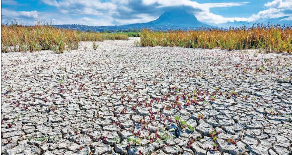
တောင်အာဖရိကတွင် မိုးခေါင်ရေရှားဖြစ်ပွားနေသည့်အတွက် မြေဆီလွှာများ ကွဲအက်နေမှုကို တွေ့ရစဉ်။

ကိတ်တောင် ဇွန် ၁၄ တောင်အာဖရိကနိုင်ငံသည် မိုးခေါင် မှုဒဏ်ကို ခါးစည်းခံနေရသည့် အပြင် ပြည်တွင်းရေလျှောင့်ကန် များလည်း ခြောက်သွေ့လာသည့် အတွက် ဇွန် ၁၃ ရက်မှစတင်ကာ မြို့နယ်အများအပြားတွင် ရေသုံးစွဲ မှုကို လျှော့ချလိုက်ကြောင်း ဆင်ယွာသတင်းတစ်ရပ်အရ သိရ သည်။ ဇွန် ၁၃ ရက်မှ စတင်ကာ မြို့နယ်များ၌ နေ့စဉ်ရေသုံးစွဲမှု ခြောက်နာရီကြာ ဖြတ်တောက် သွားမည်ဖြစ်ကြောင်း သိရသည်။ ဒေသတွင်း ရေလျှောင့်ကန် တစ်ခု ဖြစ်သည့် အင်ပိုဖရေလျှောင့်ကန် ခန်းခြောက်ပြီးနောက် အဆိုပါ ရေခွဲတမ်း ထွက်ပေါ်လာခြင်း ဖြစ်သည်။