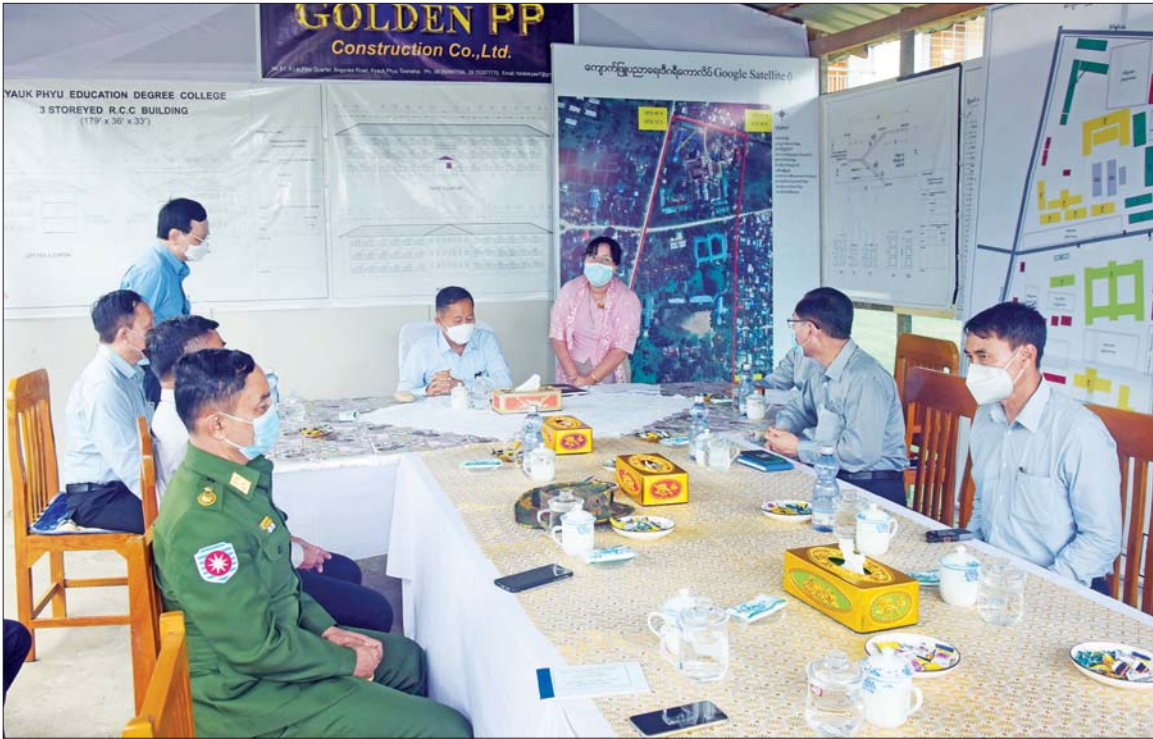
နိုင်ငံတော်စီမံအုပ်ချုပ်ရေးကောင်စီ ဒုတိယဥက္ကဋ္ဌ ဒုတိယတပ်မတော် ကာကွယ်ရေးဦးစီးချုပ် ကာကွယ်ရေးဦးစီးချုပ်(ကြည်း) ဒုတိယဗိုလ်ချုပ်မှူးကြီး စိုးဝင်း ကျောက်ဖြူပညာရေး ဒီဂရီကောလိပ်၌ တာဝန်ရှိသူများအား တွေ့ဆုံအမှာစကားပြောကြားစဉ်။

ညှိနှိုင်းဆောင်ရွက်ပေး ထို့နောက် နိုင်ငံတော်စီမံအုပ်ချုပ်ရေးကောင်စီ ဒုတိယ ဥက္ကဋ္ဌ ဒုတိယတပ်မတော် ကာကွယ်ရေးဦးစီးချုပ် ကာကွယ်ရေးဦးစီးချုပ်(ကြည်း)နှင့် အဖွဲ့များသည် ကျောက်ဖြူမြို့ ပြည်သူ့ဆေးရုံသို့သွားရောက်၍ ဆေးရုံအစည်းအဝေးခန်းမတွင် ဆေးရုံအုပ်ကြီးနှင့် ကျန်းမာရေးဝန်ထမ်းများကို တွေ့ဆုံ၍ တင်ပြချက်များအပေါ် လိုအပ်သည်များ ပေါင်းစပ်ညှိနှိုင်းဆောင်ရွက်ပေးသည်။ သင်ကြားရေးဆိုင်ရာ ကိစ္စရပ်များ ဆွေးနွေး ယင်းနောက် နိုင်ငံတော်စီမံအုပ်ချုပ်ရေးကောင်စီ ဒုတိယဥက္ကဋ္ဌ ဒုတိယတပ်မတော် ကာကွယ်ရေးဦးစီးချုပ် ကာကွယ်ရေးဦးစီးချုပ်(ကြည်း)နှင့် အဖွဲ့များသည် ကျောက်ဖြူပညာရေးဒီဂရီကောလိပ်သို့ သွားရောက်၍ တာဝန်ရှိသူများနှင့်တွေ့ဆုံကာ ကျောင်းအုပ်ချုပ်မှုဆိုင်ရာကိစ္စရပ်များနှင့် သင်ကြားရေးဆိုင်ရာကိစ္စရပ်များအား ဆွေးနွေးပြီး တင်ပြချက်များအပေါ် လိုအပ်သည်များညှိနှိုင်းဖြည့်ဆည်း ဆောင်ရွက်ပေးခဲ့ကြောင်း သတင်းရရှိသည်။ သတင်းစဉ်