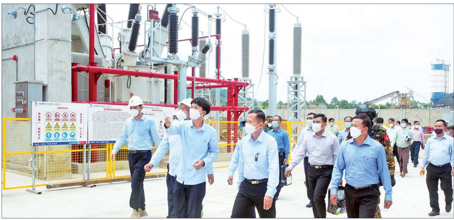
နိုင်ငံတော်စီမံအုပ်ချုပ်ရေးကောင်စီ ဒုတိယဥက္ကဋ္ဌ ဒုတိယတပ်မတော် ကာကွယ်ရေးဦးစီးချုပ် ကာကွယ်ရေးဦးစီးချုပ်(ကြည်း) ဒုတိယဗိုလ်ချုပ်မှူးကြီး စိုးဝင်း ကျောက်ဖြူမြို့ရှိ သဘာဝဓာတ်ငွေ့နှင့် စွန့်ပစ်အပူသုံး လျှပ်စစ်ဓာတ်အားပေး စီမံကိန်းတည်ဆောက်နေမှုအား လေ့လာကြည့်ရှုစဉ်။

နေပြည်တော် ဇွန် ၁၄ နိုင်ငံတော်စီမံအုပ်ချုပ်ရေး ကောင်စီ ဒုတိယ ဥက္ကဋ္ဌ ဒုတိယတပ်မတော် ကာကွယ်ရေးဦးစီးချုပ် ကာကွယ်ရေး ဦးစီးချုပ်(ကြည်း) ဒုတိယဗိုလ်ချုပ်မှူးကြီး စိုးဝင်းသည် နိုင်ငံတော်စီမံအုပ်ချုပ်ရေး ကောင်စီ အဖွဲ့ဝင်များဖြစ်ကြသည့် ဒေါ်အေးနုစိန်၊ ဦးရွှေကြိမ်၊ ရခိုင်ပြည်နယ် ဝန်ကြီးချုပ် ဒေါက်တာ အောင်ကျော်မင်း၊ ကာကွယ်ရေး ဦးစီးချုပ်ရုံးမှ တပ်မတော် အရာရှိကြီးများ၊ အနောက်ပိုင်းတိုင်း စစ်ဌာနချုပ် တိုင်းမှူး၊ ဒုတိယဝန်ကြီးများ လိုက်ပါ၍ ယနေ့နံနက်ပိုင်းတွင် တည်ဆောက်ဆဲ ကျောက်ဖြူမြို့ရှိ သဘာဝဓာတ်ငွေ့နှင့် စွန့်ပစ်အပူသုံး လျှပ်စစ်ဓာတ်အားပေး စီမံကိန်းသို့ သွားရောက် လေ့လာကြည့်ရှုကြသည်။ ဦးစွာ နိုင်ငံတော်စီမံအုပ်ချုပ်ရေး ကောင်စီဒုတိယဥက္ကဋ္ဌ ဒုတိယတပ်မတော် ကာကွယ်ရေးဦးစီးချုပ် ကာကွယ်ရေး စာမျက်နှာ ၅ ကော်လံ ၁ ❖