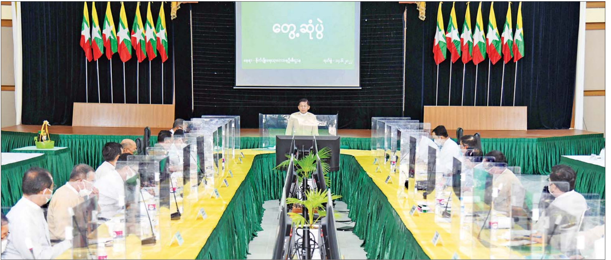
နိုင်ငံတော်စီမံအုပ်ချုပ်ရေးကောင်စီဥက္ကဋ္ဌ နိုင်ငံတော်ဝန်ကြီးချုပ် ဗိုလ်ချုပ်မှူးကြီး မင်းအောင်လှိုင် စိုက်ပျိုးရေး၊ မွေးမြူရေးနှင့် ဆည်မြောင်းဝန်ကြီးဌာနမှ တာဝန်ရှိသူများနှင့်တွေ့ဆုံ၍ စိုက်ပျိုးရေးကဏ္ဍ ဖွံ့ဖြိုးတိုးတက်ရေးဆိုင်ရာကိစ္စရပ်များကို ဆွေးနွေးမှာကြားစဉ်။

● ရှေ့ဖို့မှ ညွှန်ကြားရေးမှူးချုပ်များ၊ ပါမောက္ခချုပ်များနှင့် တာဝန်ရှိသူများ တက်ရောက်ကြသည်။