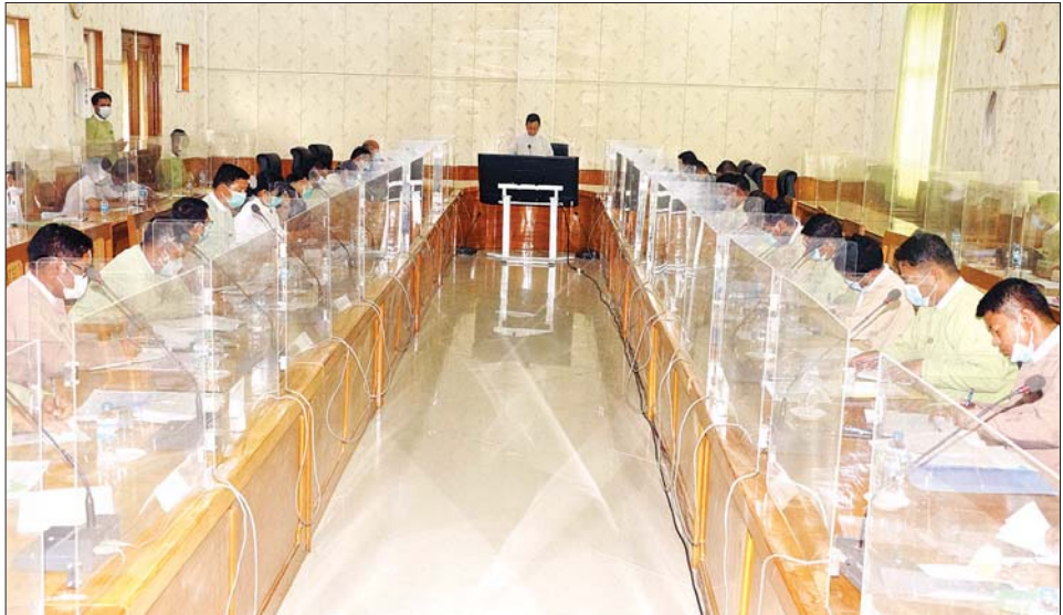
နေပြည်တော်ကောင်စီဥက္ကဋ္ဌ ဒေါက်တာမောင်မောင်နိုင် လုပ်ငန်းညှိနှိုင်းအစည်းအဝေး၌ အမှာစကား ပြောကြားစဉ်။

ရှေးဦးစွာ နေပြည်တော် ဆောင်ရွက်၍ နေပြည်တော် ကောင်စီဥက္ကဋ္ဌ ဒေါက်တာ ကောင်စီသို့ စိစစ်တင်ပြကြစေ မောင်မောင်နိုင်က နေပြည်တော် လိုကြောင်း ပြောကြားသည်။ အတွင်းရှိ လယ်ယာမြေများပေါ် ထို့နောက် နေပြည်တော် အခြားနည်းများ အသုံးပြု၍ ကောင်စီအဖွဲ့ဝင် ဗိုလ်မှူးကြီး မြို့ပြဖွံ့ဖြိုးရေးလှည့်ကျနှင့် အညီ မင်းနောင်က လယ်ယာမြေများ ခွင့်ပြုမိန့်ရရှိခြင်းမရှိဘဲ တရား မဝင်လုပ်ငန်းများ လုပ်ကိုင် ပေါ်တွင် ခွင့်ပြုမိန့်ရရှိခြင်းမရှိဘဲ တရားမဝင်လုပ်ငန်းများ လုပ်ကိုင် ဆောင်ရွက်နေသည်ကို တွေ့ရှိရ ဆောင်ရွက်နေမှုနှင့် ပတ်သက်၍ သဖြင့်မလိုလားအပ်သောကိစ္စများ ဆောင်ရွက်မည့် လုပ်ငန်းစဉ်များ မဖြစ်ပေါ်စေရေး သက်ဆိုင်ရာ ကို ရှင်းလင်းပြောကြားသည်။ ဌာနများအနေဖြင့် ကြီးကြပ် ယင်းနောက်တက်ရောက်လာ သတင်းစဉ်