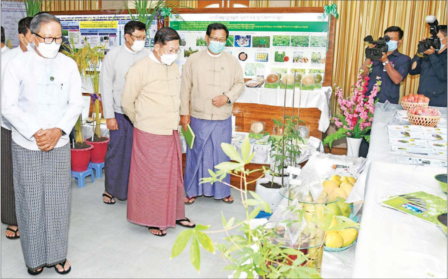
နိုင်ငံတော်စီမံအုပ်ချုပ်ရေးကောင်စီဥက္ကဋ္ဌ နိုင်ငံတော်ဝန်ကြီးချုပ် ဗိုလ်ချုပ်မှူးကြီး မင်းအောင်လှိုင်နှင့် တာဝန်ရှိသူများ စိုက်ပျိုးရေးသုတေသနဦးစီးဌာန ပြခန်းများအား လှည့်လည်ကြည့်ရှုစဉ်။

စနစ်တကျဖြင့် မွေးမြူရန်လို မွေးမြူရေးနှင့် ပတ်သက်၍ မိမိတို့နိုင်ငံတွင် ကြက်၊ ဝက်၊ ဆိတ်၊ နွားနှင့် ငါးတို့ကို အဓိကစားသုံးကြကြောင်း၊ ၎င်းတို့အတွက် မွေးမြူရေးပညာရှင်များ လည်း လိုအပ်ကြောင်း၊ ကြက်မွေးမြူရေးလုပ်ငန်းများတွင် လိုအပ်ချက်များ များစွာရှိကြောင်း၊ မွေးမြူရေးလုပ်ငန်းများ၌ လှောင်မွေးသည့်စနစ်၊ လွှတ်မွေးသည့်စနစ်နှင့် လှန်မွေးသည့်စနစ် သုံးမျိုးရှိပြီး လှောင်မွေးသည့်စနစ်သည် အကောင်းဆုံးဖြစ်ကြောင်း၊ တိရစ္ဆာန်များကို အစာပြည့်ဝစွာ ကျွေးမွေးပြီး စနစ်တကျဖြင့် မွေးမြူရန်လိုကြောင်း၊ အခြေခံကျသည့် မွေးမြူရေးလုပ်ငန်းများ ဆောင်ရွက်ရန်အတွက် မွေးမြူရေးပညာရှင်များနှင့် မွေးမြူရန်လိုကြောင်း၊ ထို့ကြောင့် မိမိအနေဖြင့် နိုင်ငံတော်စီမံအုပ်ချုပ်ရေးကောင်စီဥက္ကဋ္ဌ တာဝန်ထမ်းဆောင်ချိန်တွင် စိုက်ပျိုးမွေးမြူရေးပညာရှင်များ မွေးထုတ်နိုင်ရေးအတွက် စိုက်ပျိုးရေးနှင့် မွေးမြူရေးသိပ္ပံကျောင်းများ၊ ကောလိပ်နှင့်တက္ကသိုလ်များတိုးချဲ့ ဖွင့်လှစ်နိုင်ရေး ဆောင်ရွက်လျက်ရှိကြောင်း၊ အိမ်နီးချင်းနိုင်ငံများတွင်လည်း စိုက်ပျိုးမွေးမြူရေးနှင့် ပတ်သက်သည့် တက္ကသိုလ်များ၊ ကောလိပ်များသည် မိမိတို့နိုင်ငံထက် များပြားသည်ကို တွေ့ရှိရကြောင်း၊ မိမိတို့နိုင်ငံသည် စိုက်ပျိုးရေးကို အခြေခံသည့် နိုင်ငံဖြစ်သော်လည်း စိုက်ပျိုးရေးတက္ကသိုလ်တစ်ခုသာ ရှိပါကြောင်း၊ စိုက်ပျိုးရေးပညာရှင်များ များစွာမွေးထုတ်ပေးရန် လိုနေသေးကြောင်း၊ စိုက်ပျိုးမွေးမြူရေးနှင့် ပတ်သက်သည့် ပညာရှင်များ မွေးထုတ်ပေးနိုင်မည်ဆိုပါက မိမိတို့နိုင်ငံ၏ စိုက်ပျိုးမွေးမြူရေးလုပ်ငန်းများ အတွက် လိုအပ်သည့် လူသားအရင်းအမြစ်များ