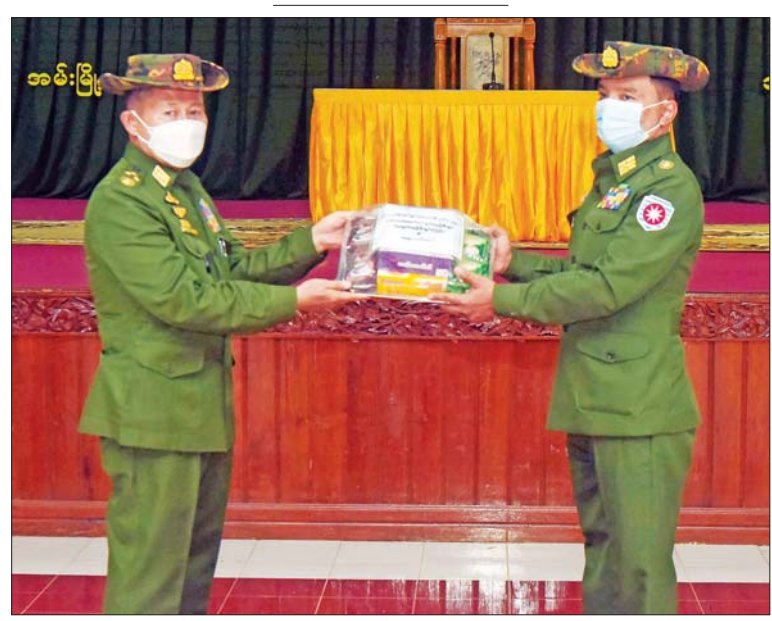
နိုင်ငံတော်စီမံအုပ်ချုပ်ရေးကောင်စီ ဒုတိယဥက္ကဋ္ဌ ဒုတိယတပ်မတော်ကာကွယ်ရေး ဦးစီးချုပ် ကာကွယ်ရေးဦးစီးချုပ်(ကြည်း) ဒုတိယဗိုလ်ချုပ်မှူးကြီး စိုးဝင်း အမ်းတပ်နယ်ရှိ အရာရှိ၊ စစ်သည် မိသားစုများအတွက် စားသောက်ဖွယ်ရာ ပစ္စည်း များ ပေးအပ်စဉ်။

လုပ်ငန်းတာဝန်နှင့် ကွပ်ကဲမှုစနစ် အရ ရာထူးအဆင့်များ ခန့်အပ်တာဝန်ပေး ထားကာ တူညီသော ယူနီဖောင်းဝတ်ထား ပြီး တူညီသော လုပ်ငန်းတာဝန်များကို ထမ်းဆောင်နေကြရသူများဖြစ်၍ ရဲဘော် ရဲဘက်စိတ်ဖြင့် ချစ်ကြည်ရင်းနှီးစွာ နေထိုင်လုပ်ကိုင်ကြရန် လိုကြောင်း၊ အထက်အောက် ထိတွေ့ဆက်ဆံမှုတွင် တာဝန်ရှိသူများအနေဖြင့် အလွတ် သဘော ထိတွေ့ဆက်ဆံမှုများရှိသကဲ့သို့