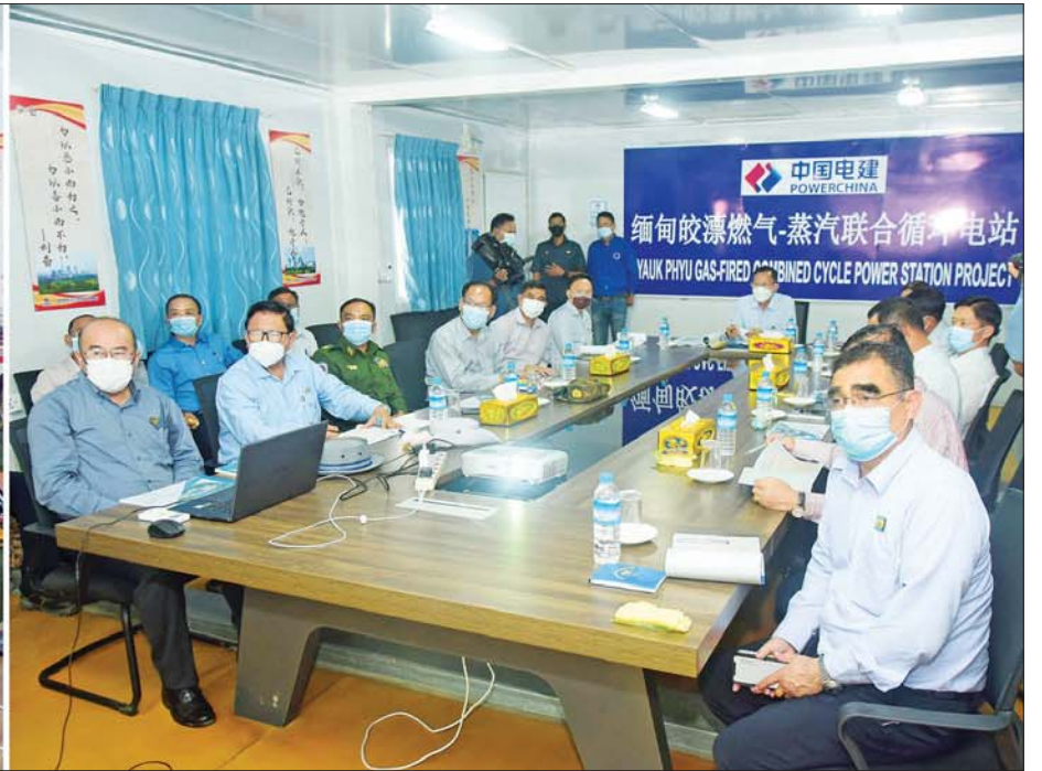
နိုင်ငံတော်စီမံအုပ်ချုပ်ရေးကောင်စီ ဒုတိယဥက္ကဋ္ဌ ဒုတိယတပ်မတော် ကာကွယ်ရေးဦးစီးချုပ် ကာကွယ်ရေးဦးစီးချုပ်(ကြည်း) ဒုတိယဗိုလ်ချုပ်မှူးကြီး စိုးဝင်းအား ကျောက်ဖြူမြို့ရှိ သဘာဝဓာတ်ငွေ့နှင့် စွန့်ပစ်အပူသုံး လျှပ်စစ်ဓာတ်အားပေး စီမံကိန်းအကောင်အထည်ဖော် ဆောင်ရွက်နေမှုနှင့် ပတ်သက်၍ တာဝန်ရှိသူတစ်ဦးက ရှင်းလင်းတင်ပြစဉ်။