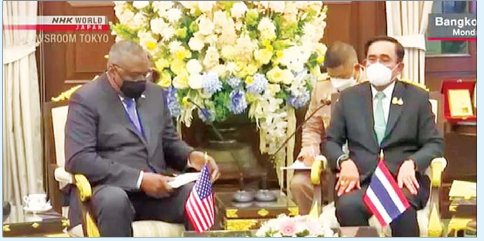
အမေရိကန်ကာကွယ်ရေးဝန်ကြီး လွှဲကြီးအော်စတင်နှင့် ထိုင်းဝန်ကြီးချုပ် ပရာယတ်ချန်အိုချာတို့ တွေ့ဆုံစဉ်။

ထောက်ပံ့ပေးလိုကြောင်း အလေးပေးပြောကြားသည်။ ထို့အပြင် လာမည့်နှစ်၌ ကော်ဘရာဂိုးလ်စစ်ရေး လေ့ကျင့်မှုကို အင်အားအပြည့်ဖြင့် ပြန်လည် စတင်ရန်လည်း ဆွေးနွေးခဲ့ကြောင်း၊ ကိုဗစ်-၁၉ ကပ်ရောဂါကြောင့် လွန်ခဲ့သည့်နှစ်နှစ်အတွင်း ကော်ဘရာဂိုးလ်ပူးတွဲစစ်ရေးလေ့ကျင့်မှုကို အင်အား လျှော့ချခဲ့ကြောင်း သိရသည်။ အမေရိကန်ကာကွယ်ရေးဝန်ကြီးသည် ထိုင်းနိုင်ငံ သို့ မလာရောက်မီ စင်ကာပူနိုင်ငံတွင် ပြုလုပ်သည့် ရှန်ဂိုလီလာလုံခြုံရေးဆွေးနွေးပွဲသို့ တက်ရောက်ခဲ့ ကြောင်း သိရသည်။ အင်န်အိတ်ချီကေ