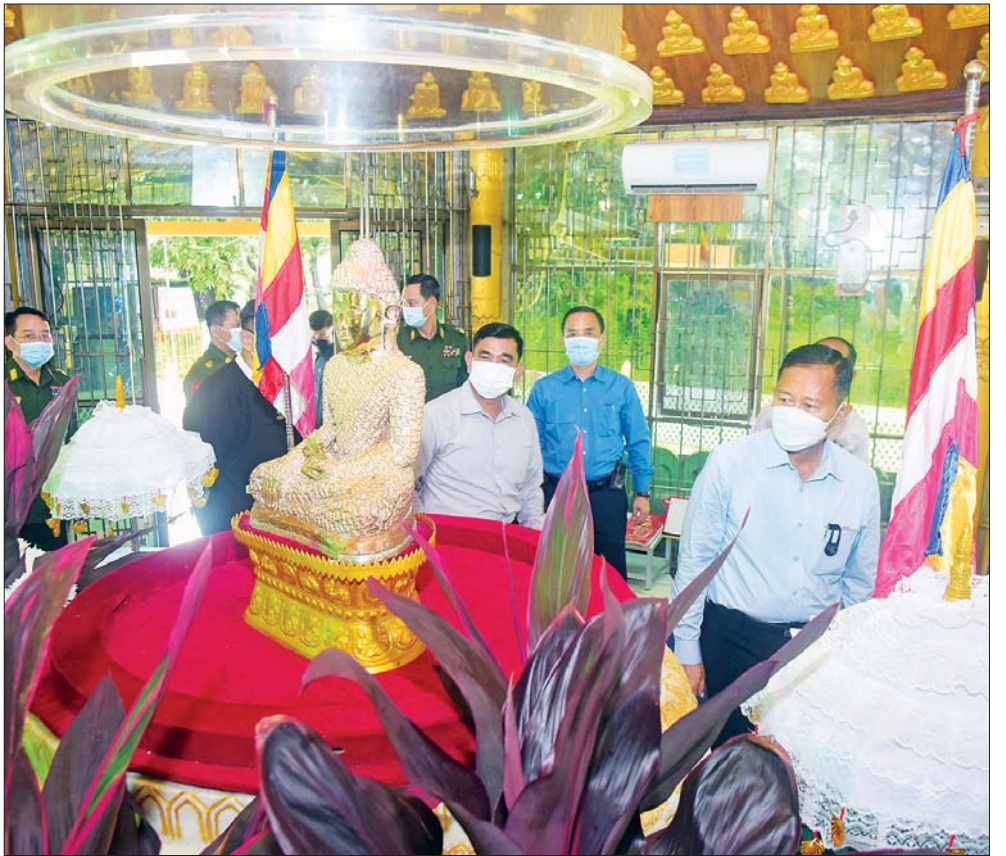
နိုင်ငံတော်စီမံအုပ်ချုပ်ရေးကောင်စီဒုတိယဥက္ကဋ္ဌ ဒုတိယတပ်မတော်ကာကွယ်ရေးဦးစီးချုပ် ကာကွယ်ရေးဦးစီးချုပ်(ကြည်း) ဒုတိယဗိုလ်ချုပ်မှူးကြီး စိုးဝင်း စစ်တွေမြို့ရှိ လောကနန္ဒာစေတီတော်မြတ်ကြီးအတွက် အလှူငွေ များ ပေးအပ်လှူဒါန်းစဉ်။