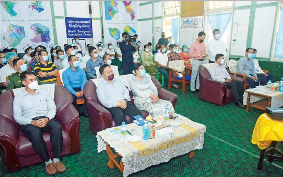
နိုင်ငံတော်စီမံအုပ်ချုပ်ရေးကောင်စီ ဒုတိယဥက္ကဋ္ဌ ဒုတိယတပ်မတော် ကာကွယ်ရေးဦးစီးချုပ် ကာကွယ်ရေးဦးစီးချုပ်(ကြည်း) ဒုတိယဗိုလ်ချုပ်မှူးကြီး စိုးဝင်း ကျောက်ဖြူမြို့ပြည်သူ့ဆေးရုံ၌ ဆေးရုံအုပ်ကြီးနှင့် ကျန်းမာရေးဝန်ထမ်းများကို တွေ့ဆုံအမှာစကားပြောကြားစဉ်။

ဦးစီးချုပ်(ကြည်း)နှင့်အဖွဲ့အား စက်ရုံစီမံကိန်း အစည်းအဝေးခန်းမ၌ စီမံကိန်း တာဝန်ခံ ဦးအောင်ကိုလတ်နှင့် ဒုတိယမန်နေဂျာ ဦးမင်းသွင်ခန့်တို့က စီမံကိန်းအကောင်အထည်ဖော် ဆောင်ရွက်နေမှုကို ဝါဝါပျိုင့်ဖြင့် ရှင်းလင်းတင်ပြကြရာ နိုင်ငံတော်စီမံ အုပ်ချုပ်ရေးကောင်စီ ဒုတိယဥက္ကဋ္ဌ ဒုတိယတပ်မတော် ကာကွယ်ရေးဦးစီးချုပ်ကာကွယ်ရေးဦးစီးချုပ် (ကြည်း)က သိရှိလိုသည်များ မေးမြန်းပြီး စက်ရုံလုပ်ငန်း စတင်လည်ပတ်ပါက ၁၃၅ MW ဓာတ်အား ထွက်ရှိမည်ဖြစ်ပြီး ၁ ယူနစ် လျှင် ၈ ဒသမ ၅၉ ဆင့် နှုန်းဖြင့် ဖြန့်ချိနိုင်မည်ဖြစ်၍ ဒေသအတွက် များစွာအကျိုးရှိနိုင်မည့် အခြေအနေ၊ စက်ရုံစီမံကိန်းအကောင်အထည်ဖော်မှုနှင့် စက်ရုံလည်ပတ်ချိန်တွင် သဘာဝပတ်ဝန်းကျင်ထိခိုက်မှုမရှိစေရေး ဆောင်ရွက်ရန်အခြေအနေ၊ စက်ရုံပတ်ဝန်းကျင် ဒေသပံ့ပြည်သူများအတွက် ကျန်းမာရေး၊ ပညာရေးနှင့်ပတ်သက်သော Corporate