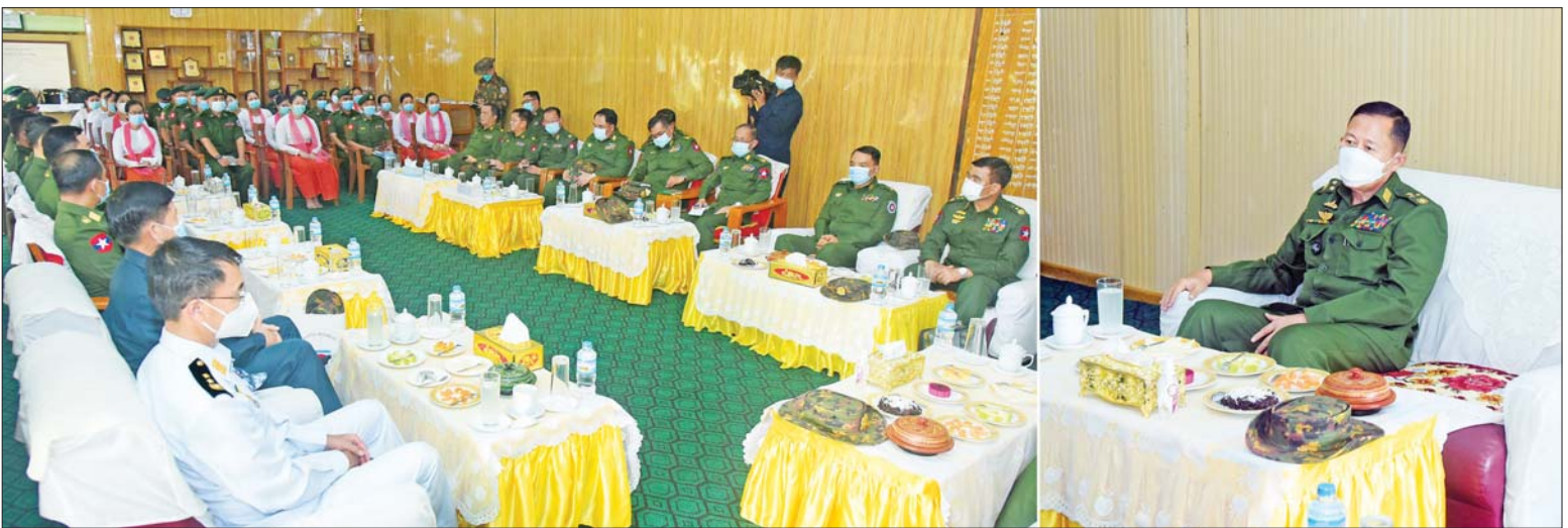
နိုင်ငံတော်စီမံအုပ်ချုပ်ရေးကောင်စီ ဒုတိယဥက္ကဋ္ဌ ဒုတိယတပ်မတော်ကာကွယ်ရေးဦးစီးချုပ် ကာကွယ်ရေးဦးစီးချုပ်(ကြည်း) ဒုတိယဗိုလ်ချုပ်မှူးကြီး စိုးဝင်း ကျောက်ဖြူ တပ်နယ်မှ အရာရှိ၊ စစ်သည် မိသားစုဝင်များအား တွေ့ဆုံအမှာစကားပြောကြားစဉ်။

နေပြည်တော် ဇွန် ၁၄ နိုင်ငံတော် စီမံအုပ်ချုပ်ရေးကောင်စီ ဒုတိယဥက္ကဋ္ဌ ဒုတိယတပ်မတော် ကာကွယ်ရေးဦးစီးချုပ်(ကြည်း) ဒုတိယဗိုလ်ချုပ်မှူးကြီး စိုးဝင်းသည် ကာကွယ်ရေးဦးစီးချုပ်မှူးမှ ဒုတိယဗိုလ်ချုပ်ကြီး ဖုန်းမြတ်၊ ကာကွယ်ရေး ဦးစီးချုပ်ရုံး (ကြည်း) ရေ (လေ)မှ တပ်မတော်အရာရှိကြီးများ၊ အနောက်ပိုင်းတိုင်း စစ်ဌာနချုပ် တိုင်းမှူး ဗိုလ်ချုပ် ထင်လတ်ဦးနှင့် တာဝန်ရှိသူများလိုက်ပါ၍ ယနေ့တွင် ကျောက်ဖြူတပ်နယ်၊ အမ်းတပ်နယ်နှင့် ဓညဝတီရေတပ်စခန်း ဌာနချုပ်တို့မှ အရာရှိ၊ စစ်သည်မိသားစုဝင် များအား တပ်နယ်ခန်းမများနှင့် ရိပ်သာ တို့တွင် သီးခြားစီတွေ့ဆုံ၍ အမှာစကား ပြောကြားသည်။