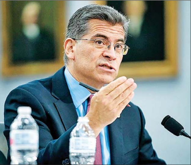
တစ်လအတွင်း နှစ်ကြိမ်မြောက် ကိုဗစ်-၁၉ ကူးစက်ဖြစ်ပွားခဲ့သော အမေရိကန်ကျန်းမာရေးဝန်ကြီး ဇာဗီရာ ဘီကာရာ။

ဝါရှင်တန် ဇွန် ၁၄ အမေရိကန် ကျန်းမာရေးနှင့်လူသားအကျိုးပြုဝန်ဆောင်မှု (အိတ်ချီ အိတ်ချီအက်စ်) ဝန်ကြီး ဇာဗီရာ ဘီကာရာသည် ဇွန် ၁၂ ရက်တွင် ကိုဗစ်-၁၉ ရောဂါ ကူးစက်ခံထားရကြောင်း၊ အဆိုပါ ကူးစက်ခံရမှုသည် တစ်လအတွင်း နှစ်ကြိမ်မြောက် ကူးစက်ခံရခြင်းဖြစ်ကြောင်း သိရသည်။ ဘီကာရာသည် ကယ်လီဖိုးနီးယားပြည်နယ် ဆာချေမန်တို၌ အေအာရီတီနည်းဖြင့် ကိုဗစ်-၁၉ ရောဂါပိုး ရှိမရှိ စမ်းသပ်စစ်ဆေးခဲ့ရာ ပိုးတွေ့ရှိခဲ့ခြင်းဖြစ်ကြောင်း အိတ်ချီအိတ်ချီအက်စ်မှ ပြောရေးဆိုခွင့်ရှိသူ ဆာရာ လိုဗန်ဟီးမိက ပြောသည်။ ဘီကာရာသည် ကိုဗစ်-၁၉ ကာကွယ်ဆေးကို အပြည့်အဝထိုးနှံ ထားကြောင်း၊ ထို့အပြင် အပိုဆောင်းထိုးဆေးလည်း ထိုးနှံထားကြောင်း၊ မပြင်းထန်သော ရောဂါလက္ခဏာတွေ့ရှိရကြောင်း၊ သီးသန့်ခွဲခြား နေထိုင်ကာ ၎င်း၏ လုပ်ငန်းတာဝန်များကို ဆက်လက်လုပ်ဆောင် သွားမည်ဖြစ်ကြောင်း လိုဗန်ဟီးမိက ပြောသည်။ အသက် ၆၄ နှစ် အရွယ်ရှိ ဘီကာရာ၏ ယခင် ကိုဗစ်-၁၉ ရောဂါ ကူးစက်ခံရမှုသည် မေလအလယ်တွင်ဖြစ်ကြောင်း သိရသည်။ ဆင်ယွာ