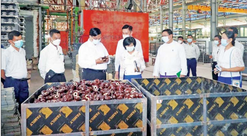
အနေဖြင့် စီးပွားရေးလုပ်ငန်းများ ဆောင်ရွက်ရာတွင် Business Plan ရေးဆွဲဆောင်ရွက်ရန်၊ ကြေးသီး များ သတ်မှတ်စံချိန်စံညွှန်းများနှင့် အညီ သုံးစွဲသူအကြိုက် ထုတ်လုပ် နိုင်ရေး ကြိုးပမ်းဆောင်ရွက်ရန်၊ ဝန်ထမ်းများအနေဖြင့် အရင်းကျေ ပြီး နှစ်စဉ်အကျိုးအမြတ်ရရှိ၍ စက်ရုံရေရှည်ရပ်တည်လည်ပတ် နိုင်ရေးအတွက် ကြိုးစားဆောင် ရွက်ရန်၊ မိမိထုတ်ကုန်ပစ္စည်းများ နှင့်ပတ်သက်၍ ဈေးကွက်သုတေ သနလုပ်ငန်းများ ကျယ်ကျယ် ပြန့်ပြန့် ဆောင်ရွက်ရန်၊ စက်ရုံပိုင် မြေနေရာများတွင် ဆိုလာလျှပ်စစ် စွမ်းအင်ထုတ်လုပ်လိုသည့် လုပ်ငန်း ရှင်များ ဖိတ်ခေါ်ပြီး လျှပ်စစ်ဓာတ် အား ထုတ်ယူသုံးစွဲနိုင်ရေးအတွက်

နေပြည်တော် မေ ၂၇ စက်မှုဝန်ကြီးဌာန ပြည်ထောင်စု ဝန်ကြီး ဒေါက်တာချာလီသန်း သည် မကွေးတိုင်းဒေသကြီး စီးပွားရေးရာဝန်ကြီး ဦးအောင်ချိန် နှင့်အတူ မေ ၂၆ ရက် နံနက်ပိုင်း က မကွေးတိုင်းဒေသကြီး မကွေး မြို့ရှိ အချို့ရည်နှင့် ရေခဲစက်ရုံ (မကွေး) သို့ရောက်ရှိပြီး လိုအပ် သည့်များ မှာကြားကာ စက်ရုံ အတွင်း လှည့်လည်ကြည့်ရှု စစ်ဆေးသည်။