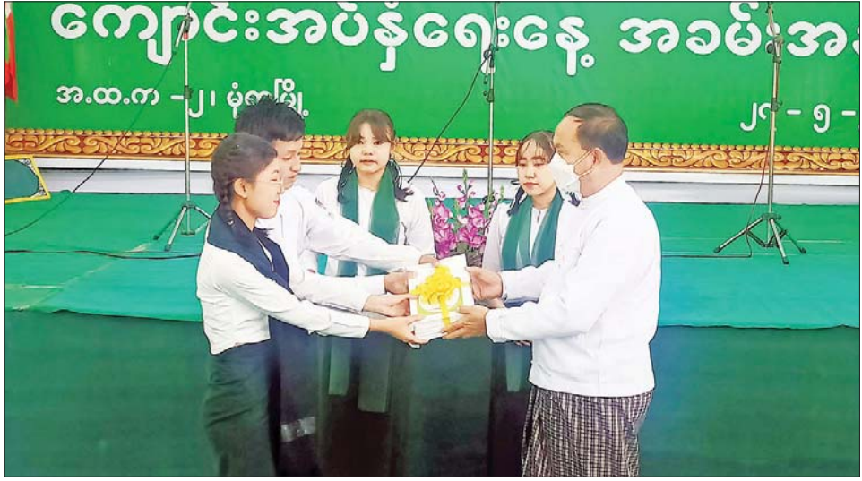
ခဲတံ၊ အလယ်တန်းနှင့် အထက်တန်းတွင်ဘောပင်၊ မူလတန်းကျောင်းများ (Grade-1 မှ Grade-5 အထိ) ဗလာစာအုပ်၊ ပုံနှိပ်ဘာသာစုံ အခမဲ့ပေးအပ်မည်ဖြစ် ကျောင်းဝတ်စုံများ အခမဲ့ပေးအပ်ကြောင်း သိရ ကြောင်း၊ ၂၀၂၂-၂၀၂၃ ပညာသင်နှစ်ကာလအတွင်း သည်။

ကြသည်။ (ယာပုံ) ထို့နောက် တိုင်းဒေသကြီးဝန်ကြီးချုပ်နှင့် တာဝန်ရှိသူများက ဆရာ ဆရာမများ၊ ကျောင်းသား ကျောင်းသူလေးများနှင့် ကျောင်းသားမိဘများအား ရင်းရင်းနှီးနှီး လိုက်လံနှုတ်ဆက်ပြီး ကျောင်းလာ ရောက်အပ်နှံနေမှုများကို လှည့်လည်ကြည့်ရှုကာ အားပေးစကားပြောကြားသည်။ စစ်ကိုင်းတိုင်းဒေသကြီး ပညာရေးဌာနအနေဖြင့် ၂၀၂၂ - ၂၀၂၃ ပညာသင်နှစ်အတွက် ခရိုင်နှင့် မြို့နယ် အသီးသီးတို့တွင် မေ ၂၆ ရက်နံနက်ကစတင်ပြီး ကျောင်းအပ်လက်ခံခြင်းများကို ဆောင်ရွက်လျက် ရှိရာ ယမန်နေ့အထိ ကျောင်းသား ကျောင်းသူ လေးသောင်းကျော် လာရောက်အပ်နှံခဲ့ကြပြီး ကျောင်း အပ်လက်ခံခြင်းများကို ဆက်လက်ဆောင်ရွက်လျက် ရှိကြောင်း၊ KG တန်းတွင် သင်ရိုးပုံနှိပ်စာ လေးမျိုး၊ မူလတန်း Grade-(1) မှ (5) တွင် ပုံနှိပ်၊ ဗလာစာအုပ်