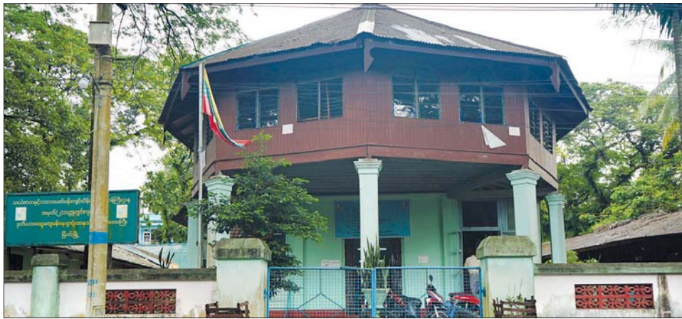
ရှေးဟောင်းအဆောက်အအုံအဖြစ် သတ်မှတ်ခံရသည့် အမှတ်(၂)သတ္တုတွင်းလုပ်ငန်းရုံး အဆောက်အအုံ။