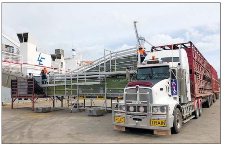
လျက်ရှိသည်။ ယင်းက အမေရိကန်၊ တောင်အာဖရိကနှင့် အာဂျင်တီးနားတို့ကဲ့သို့ ပြိုင်ဘက်များထက် သာလွန်ကောင်းမွန်စေပြီး သြစတြေးလျပိုင်သည် ဂျပန်နိုင်ငံတွင် ထူးထူးခြားခြား ထုတ်ကုန်တစ်ခုအဖြစ် ရှိနေသေးကြောင်း သိရသည်။

JAEPA အပြင် အီးယူ နယူးဇီလန်နှင့် အမေရိကန်နိုင်ငံတို့က ဂျပန်နိုင်ငံသို့ တင်ပို့မှုအတွက် ကုန်သွယ်ရေးသဘောတူညီချက်များ ရရှိထားပြီးဖြစ်သည်။ JAEPA အရ လက်မှတ်ရေးထိုးစဉ်ကတည်းက သြစတြေးလျပိုင်များသည် ဂျပန်ဈေးကွက်တွင် အကောက်ခွန်ကင်းလွတ်ခွင့်ရရှိနေပြီဖြစ်ပြီး ဂျပန်နိုင်ငံသို့ဝင်တင်ပို့မှုသည် ၂၆ ဒသမ ၆ ရာခိုင်နှုန်းတိုးလာပြီး ၂၀၁၄ ခုနှစ်တွင် ဒေါ်လာ ၄၀ ဒသမ ၄ သန်းမှ ၂၀၂၁ ခုနှစ်တွင် ၅၁ ဒသမ ၂ သန်းအထိ တိုးလာခဲ့ကြောင်း သိရသည်။ လက်ရှိတွင် အီးယူ၊ ချီလီနှင့် သြစတြေးလျတို့က ဝိုင်ကို အကောက်ခွန် သုညရာခိုင်နှုန်းဖြင့် ဂျပန်နိုင်ငံသို့ တင်ပို့