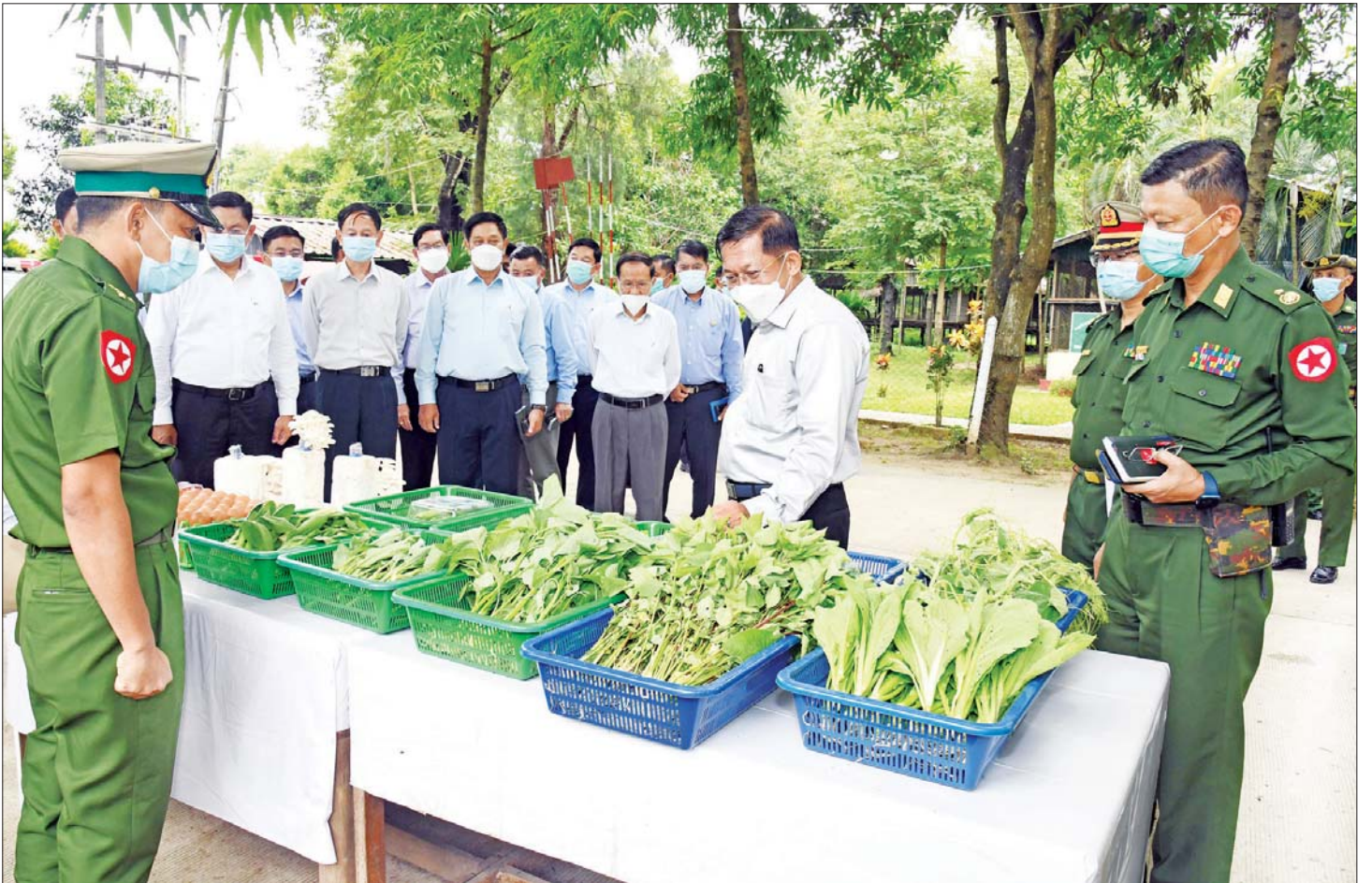
နိုင်ငံတော်စီမံအုပ်ချုပ်ရေးကောင်စီဥက္ကဋ္ဌ တပ်မတော်ကာကွယ်ရေးဦးစီးချုပ် ဗိုလ်ချုပ်မှူးကြီး မင်းအောင်လှိုင် အင်းစိန်မြို့နယ်ရှိ ရန်ကုန်တိုင်းစစ်ဌာနချုပ်၊ အမှတ်(၁) စိုက်ပျိုးမွေးမြူရေးစခန်း၌ စိုက်ပျိုးမွေးမြူရေးလုပ်ငန်းများမှ ထွက်ရှိသည့် ဟင်းသီးဟင်းရွက်များ၊ မှိုနှင့် ကြက်ဥများကို ကြည့်ရှုစစ်ဆေးစဉ်။

ရှင်းလင်းတင်ပြမှုများအပေါ် နိုင်ငံတော်စီမံ အုပ်ချုပ်ရေးကောင်စီဥက္ကဋ္ဌ တပ်မတော်ကာကွယ်ရေး ဦးစီးချုပ်က ရန်ကုန်တိုင်းစစ်ဌာနချုပ်နယ်မြေ အတွင်း ဘက်စုံစိုက်ပျိုး မွေးမြူရေးလုပ်ငန်းများ ဆောင်ရွက်စေခြင်းသည် ရန်ကုန်တိုင်းဒေသကြီး အတွင်းရှိ လူဦးရေ ၇ သန်းကျော် ၈ သန်းခန့်အား အသား၊ ငါးနှင့် ဟင်းသီးဟင်းရွက်များ ဈေးနှုန်း