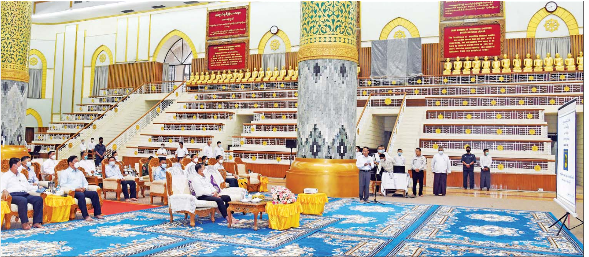
နိုင်ငံတော်စီမံအုပ်ချုပ်ရေးကောင်စီဥက္ကဋ္ဌ နိုင်ငံတော်ဝန်ကြီးချုပ် ဗိုလ်ချုပ်မှူးကြီး မင်းအောင်လှိုင် အား ပြည်ထောင်စုဝန်ကြီး ဦးကိုကို က ရန်ကုန်တိုင်းဒေသကြီး သီရိမင်္ဂလာကမ္ဘာအေးကုန်းမြေရှိ ဆဋ္ဌသင်္ဂါယနာတင် မဟာပါသာဏ လိုဏ်ဂူသိမ်တော်ကြီး အကြီးစားပြင်ဆင်မှုမိမိခြင်းလုပ်ငန်းများ ဆောင်ရွက်နေမှုအခြေအနေ ရှင်းလင်းတင်ပြစဉ်။