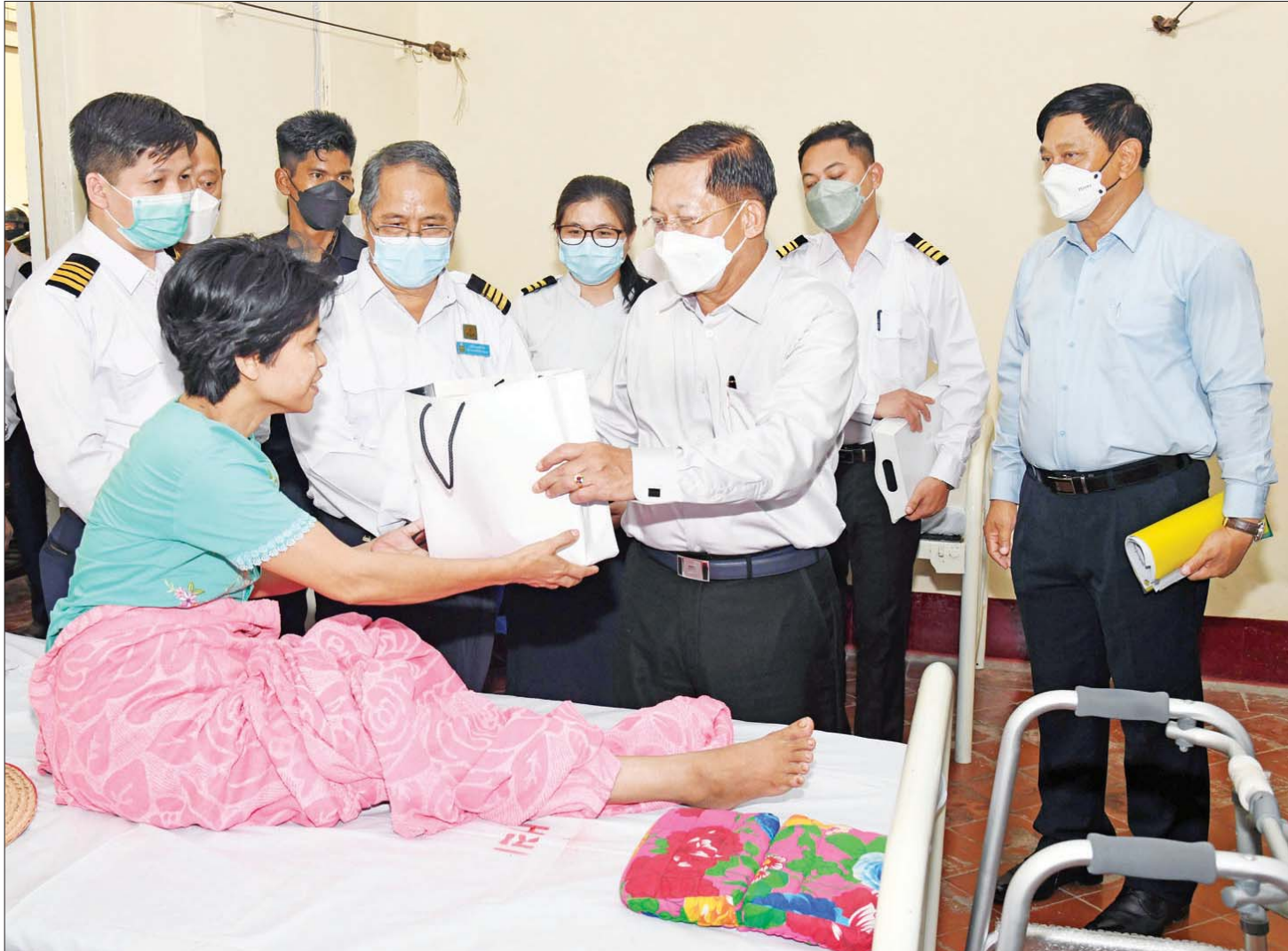
နိုင်ငံတော်စီမံအုပ်ချုပ်ရေးကောင်စီဥက္ကဋ္ဌ နိုင်ငံတော်ဝန်ကြီးချုပ် ဗိုလ်ချုပ်မှူးကြီး မင်းအောင်လှိုင် အင်းစိန်မီးရထားဆေးရုံ၌ တက်ရောက်ကုသလျက်ရှိသည့် လူနာတစ်ဦးအား စားသောက်ဖွယ်ရာများ ပေးအပ်စဉ်။

လှည့်လည်ကြည့်ရှုစစ်ဆေး ထို့နောက် နိုင်ငံတော်စီမံအုပ်ချုပ်ရေးကောင်စီ ဥက္ကဋ္ဌ နိုင်ငံတော်ဝန်ကြီးချုပ်နှင့် အဖွဲ့ဝင်များသည် ဆေးရုံအတွင်း လှည့်လည်ကြည့်ရှုစစ်ဆေးပြီး ဆေးရုံ တက်ရောက် ကုသလျက်ရှိသည့် လူနာများအား ရင်းရင်းနှီးနှီး အားပေးစကားပြောကြားကာ စားသောက်ဖွယ်ရာများ ပေးအပ်ခဲ့ကြောင်း သတင်း ရရှိသည်။