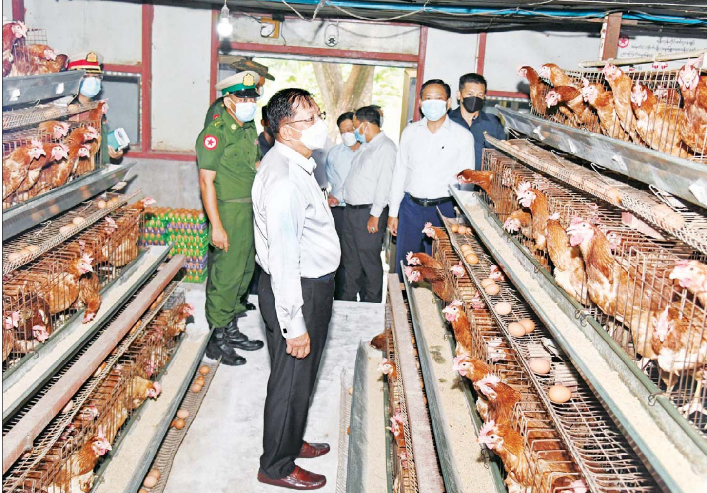
နိုင်ငံတော်စီမံအုပ်ချုပ်ရေးကောင်စီဥက္ကဋ္ဌ တပ်မတော်ကာကွယ်ရေးဦးစီးချုပ် ဗိုလ်ချုပ်မှူးကြီး မင်းအောင်လှိုင် ရန်ကုန်တိုင်းစစ်ဌာနချုပ် စိုက်ပျိုးမွေးမြူရေး ခြံအတွင်း လှည့်လည်ကြည့်ရှုစစ်ဆေးစဉ်။