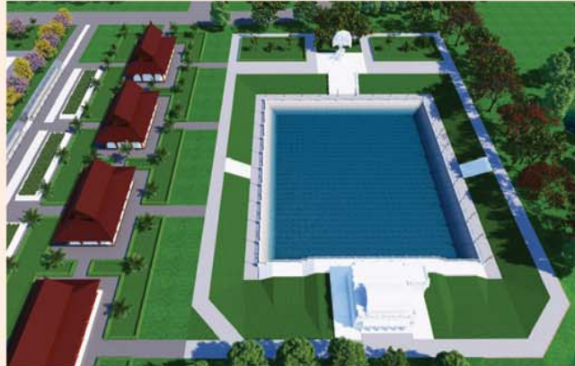
မုစလိန္နုအိုင်

၁။ နိုင်ငံတော်စီမံအုပ်ချုပ်ရေးကောင်စီဥက္ကဋ္ဌ၊ တပ်မတော်ကာကွယ်ရေးဦးစီးချုပ် ဗိုလ်ချုပ်မှူးကြီးမင်းအောင်လှိုင် ဦးဆောင်သည့် (၇)ရက်သား၊ သမီး၊ ဘုရားဒါယကာ၊ ဒါယိကာမတို့က မာရဝိဇယပုဒ္ဒရုပ်ပွားတော်မြတ်ကြီးအား မြန်မာနိုင်ငံတွင် ထေရဝါဒပုဒ္ဓသာသနာတော်ထွန်းလင်းတောက်ပလျက်ရှိသည်ကို ကမ္ဘာကိုပြသရန်၊ တိုင်းပြည်အေးချမ်းသာယာမှုရှိစေရန်၊ ရုပ်ပွားတော် မြတ်ကြီးအား ပြည်တွင်း၊ ပြည်ပဘုရားဖူးများလာရောက်ခြင်းဖြင့် ဒေသတိုးတက်စည်ကားမှုကို အထောက်အကူဖြစ်စေရန်၊ နိုင်ငံတော်ဖွံ့ဖြိုးတိုးတက်မှုအား အထောက်အကူဖြစ်စေရန် ရည်သန်လျက် ပြည်ထောင်စုနယ်မြေ နေပြည်တော်၊ ဒက္ခိဏသီရိမြို့နယ်အတွင်း၌ သာသနာတော်ထုံး၊ ရုပ်ပွားဆင်းတုတော်ထုံး၊ မြန်မာ့ရိုးရာတည်ထုံးများနှင့်အညီ တည်ဆောက်ပူဇော်လျက် ရှိပါသည်။