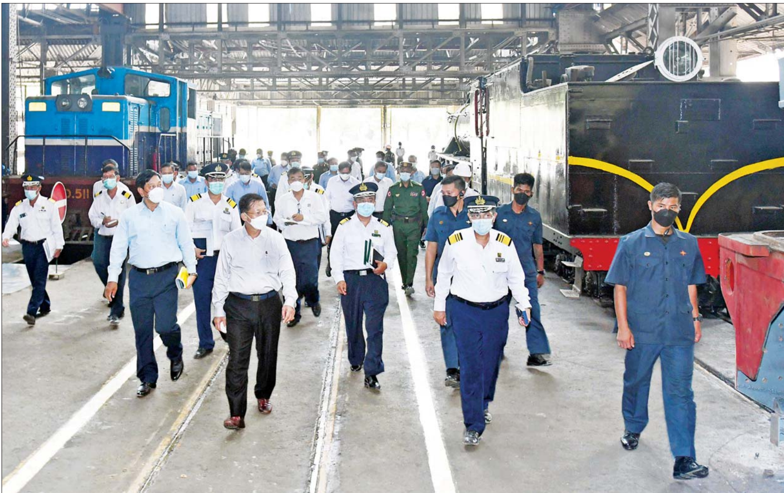
နိုင်ငံတော်စီမံအုပ်ချုပ်ရေးကောင်စီဥက္ကဋ္ဌ နိုင်ငံတော်ဝန်ကြီးချုပ် ဗိုလ်ချုပ်မှူးကြီး မင်းအောင်လှိုင် အင်းစိန်မြို့နယ်ရှိ မြန်မာ့မီးရထား၊ စက်ခေါင်းစက်ရုံ (အင်းစိန်) ၌ လှည့်လည်ကြည့်ရှုစစ်ဆေးစဉ်။

နေပြည်တော် မေ ၂၇ နိုင်ငံတော် စီမံအုပ်ချုပ်ရေးကောင်စီဥက္ကဋ္ဌ နိုင်ငံတော်ဝန်ကြီးချုပ် ဗိုလ်ချုပ်မှူးကြီး မင်းအောင်လှိုင်သည် ယနေ့နံနက်ပိုင်းတွင် ခရီးစဉ်တွင် လိုက်ပါလာသည့် အဖွဲ့ဝင်များ၊ ရန်ကုန်တိုင်းဒေသကြီး ဝန်ကြီးချုပ်၊ ရန်ကုန်တိုင်းစစ်ဌာနချုပ် တိုင်းမှူးနှင့် တာဝန်ရှိသူများ လိုက်ပါ၍ အင်းစိန်မြို့နယ်ရှိ မြန်မာ့မီးရထား၊ စက်ခေါင်းစက်ရုံ (အင်းစိန်) သို့ သွားရောက်ကြည့်ရှုစစ်ဆေးသည်။ ဦးစွာ နိုင်ငံတော်စီမံအုပ်ချုပ်ရေးကောင်စီဥက္ကဋ္ဌ နိုင်ငံတော်ဝန်ကြီးချုပ်နှင့် အဖွဲ့ဝင်များသည် မြန်မာ့မီးရထား၊ စက်ခေါင်းစက်ရုံ (အင်းစိန်) သို့ ရောက်ရှိကြရာ စက်ရုံအစည်းအဝေးခန်းမတွင် ပို့ဆောင်ရေးနှင့် ဆက်သွယ်ရေးဝန်ကြီးဌာန ပြည်ထောင်စုဝန်ကြီး ဗိုလ်ချုပ်ကြီး တင်အောင်စန်းနှင့် မြန်မာ့မီးရထားဦးဆောင်ညွှန်ကြားရေးမှူး သူရဦးအောင်မျိုးမြင့်တို့က စက်ခေါင်းစက်ရုံ (အင်းစိန်) စာမျက်နှာ ၃ ကော်လံ ၁ ❖