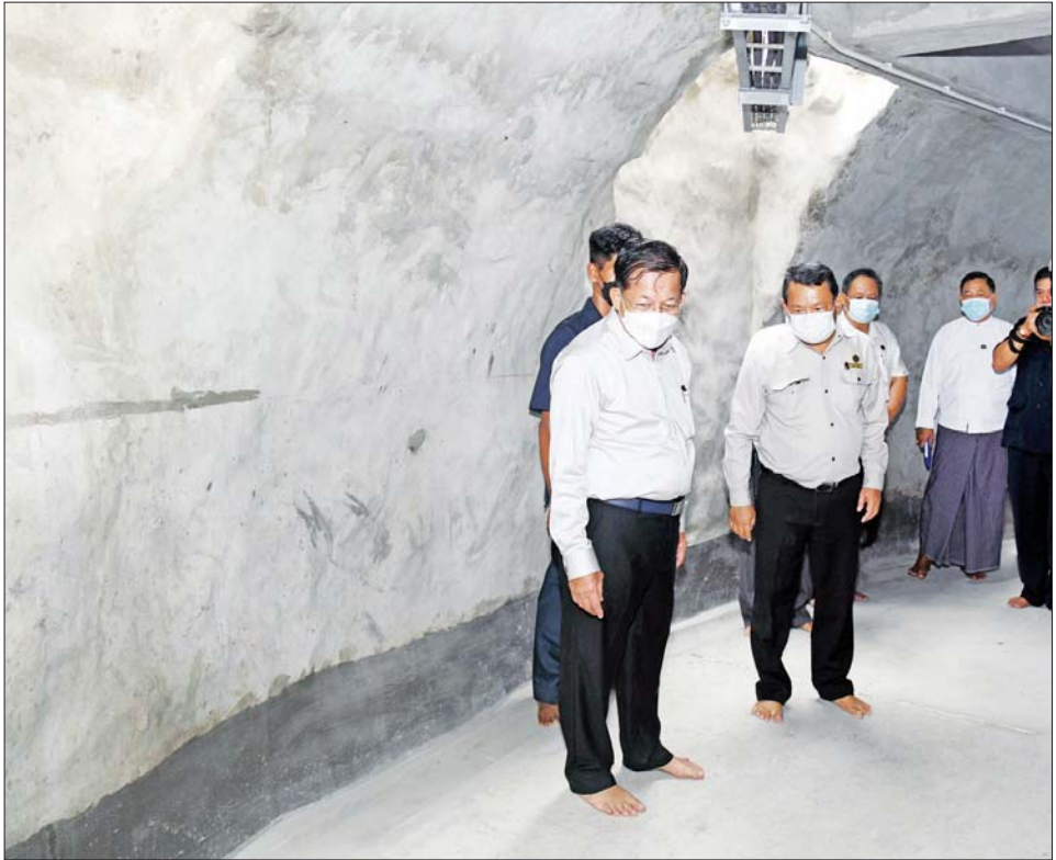
နိုင်ငံတော်စီမံအုပ်ချုပ်ရေးကောင်စီဥက္ကဋ္ဌ နိုင်ငံတော်ဝန်ကြီးချုပ် ဗိုလ်ချုပ်မှူးကြီး မင်းအောင်လှိုင် ဆဋ္ဌသင်္ဂါယနာတင် မဟာပါသာဏလိုဏ်ဂူသိမ်တော်ကြီး အကြီးစားပြင်ဆင်မှုမီးခင်းလုပ်ငန်းများ ဆောင်ရွက်ထားမှုကို ကြည့်ရှုစစ်ဆေးစဉ်။

ထို့နောက် နိုင်ငံတော်စီမံအုပ်ချုပ်ရေးကောင်စီ ဥက္ကဋ္ဌ နိုင်ငံတော်ဝန်ကြီးချုပ်နှင့် အဖွဲ့ဝင်များသည် သီရိမင်္ဂလာကမ္ဘာအေးကုန်းမြေရှိ သာသနိက အဆောက်အဦများ၊ ဟံသာသီရိကုန်းတော်ရှိ နိုင်ငံတော်ဩဝါဒါစရိယ ဆရာတော်ကြီးများနှင့် နိုင်ငံတော်ဗဟိုသံဃာ့ဝန်ဆောင် ဆရာတော်ကြီးများ လာရောက်စဉ် ခေတ္တသီတင်းသုံးသည့် အဆောင်