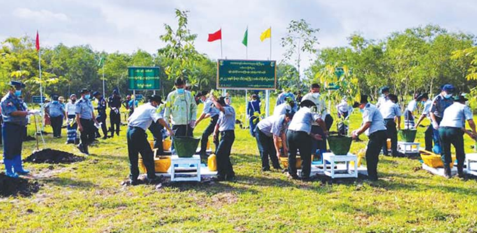
သမီးကျန်းမြို့နယ်၌ မိုးရာသီအကြို သစ်ပင်စိုက်ပျိုးပွဲကြိုစဉ်။