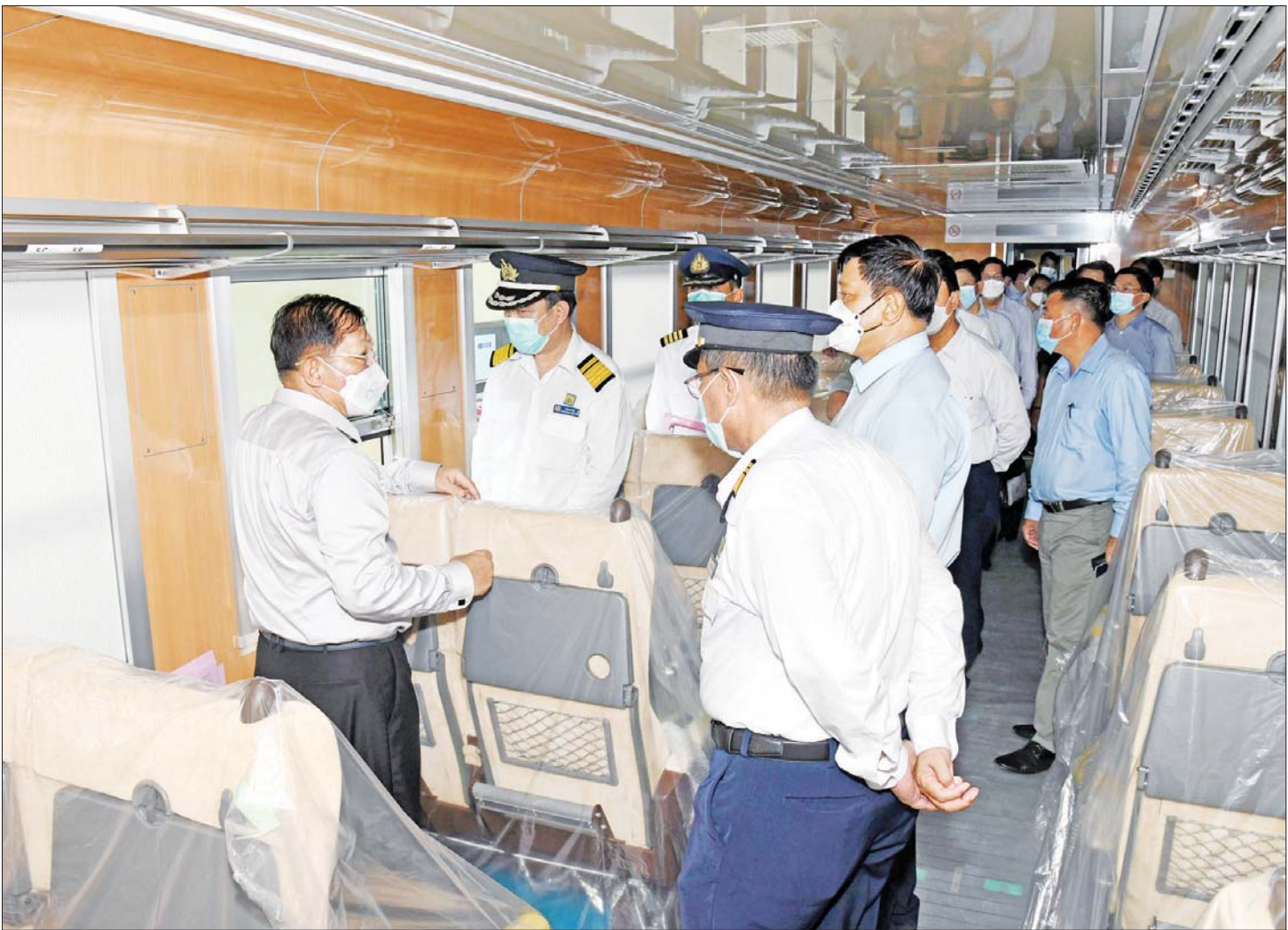
နိုင်ငံတော်စီမံအုပ်ချုပ်ရေးကောင်စီဥက္ကဋ္ဌ နိုင်ငံတော်ဝန်ကြီးချုပ် ဗိုလ်ချုပ်မှူးကြီး မင်းအောင်လှိုင် မြို့ပတ်ဒီဇယ်စက်ခေါင်းရုံ၌ ဂျပန်နိုင်ငံမှ ရောက်ရှိလာသည့် DEMU ရထားတွဲဆိုင် အသစ်များကို ကြည့်ရှုစစ်ဆေးစဉ်။

စားသောက်ဖွယ်ရာများပေးအပ် ထို့နောက် နိုင်ငံတော်စီမံအုပ်ချုပ်ရေးကောင်စီ ဥက္ကဋ္ဌ နိုင်ငံတော်ဝန်ကြီးချုပ်က စက်ရုံဝန်ထမ်းများ အတွက် စားသောက်ဖွယ်ရာများနှင့် ချီးမြှင့်ငွေများ