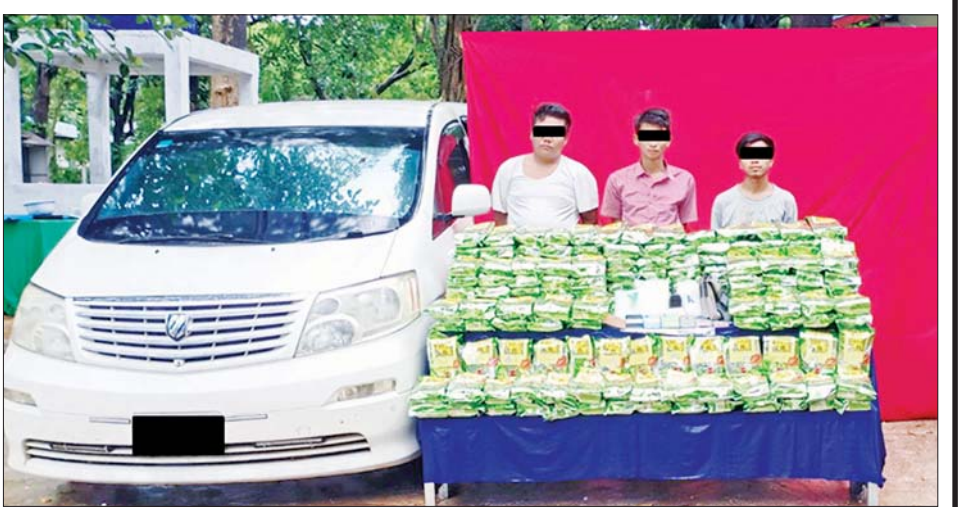
ပြစ်မှုကျူးလွန်သူများအား သိမ်းဆည်းရမိသည့် မူးယစ်ဆေးဝါးများနှင့်အတူ တွေ့ရစဉ်။