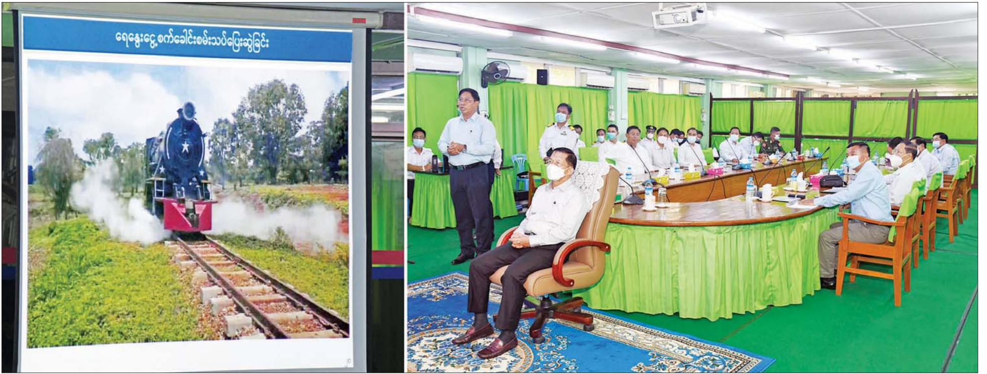
နိုင်ငံတော်စီမံအုပ်ချုပ်ရေးကောင်စီဥက္ကဋ္ဌ နိုင်ငံတော်ဝန်ကြီးချုပ် ဗိုလ်ချုပ်မှူးကြီး မင်းအောင်လှိုင် အား ပြည်ထောင်စုဝန်ကြီး ဗိုလ်ချုပ်ကြီး တင်အောင်စန်းက မြန်မာ့မီးရထား၊ စက်ခေါင်းစက်ရုံ (အင်းစိန်) လုပ်ငန်းဆောင်ရွက်မှုအခြေအနေများ ရှင်းလင်းတင်ပြစဉ်။

◆ ရှေ့ဖိုးမှ သမိုင်းအကျဉ်း၊ ရည်မှန်းချက်တာဝန်များနှင့် အကောင်အထည်ဖော် ဆောင်ရွက်နိုင်မှု အခြေအနေ၊ မီးရထားစက်ခေါင်းများ ထုတ်လုပ်တပ်ဆင်နိုင်မှု၊ ပြုပြင်ထိန်းသိမ်းနိုင်မှု၊ စက်ခေါင်းစွမ်းအား မြှင့်တင်မှု၊ စက်ခေါင်းအရန်ပစ္စည်းများ ထုတ်လုပ်နိုင်မှုအခြေအနေ၊ ရေဓနွေးငွေ့စက်ခေါင်းများ အကြီးတန်း ပြုပြင်ပြီးစီးမှုနှင့် စမ်းသပ်မောင်းနှင် ပြေးဆွဲနိုင်မှု အခြေအနေ၊ စက်ရုံဝန်ထမ်းများ အရည်အသွေး ပြည့်ဝစေရေးအတွက် သင်တန်းများ တက်ရောက်စေမှု၊ စက်ရုံ အလုပ်ရုံခွဲများအလိုက် လုပ်ငန်းများ ဆောင်ရွက်နေမှု၊ လုပ်ငန်းခွင် ဘေးအန္တရာယ် ကင်းရှင်းရေး ဆောင်ရွက်ထားရှိမှု၊ မီးဘေးအန္တရာယ် ကာကွယ်ရေး ဆောင်ရွက်ထားရှိမှုအခြေအနေများကို ရှင်းလင်းတင်ပြကြသည်။