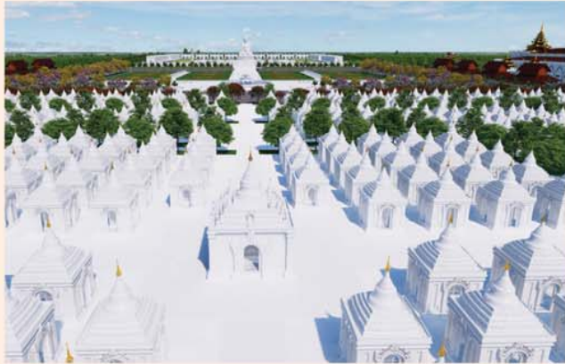
ကျောက်စာရုံစေတီ(၁၂ x ၁၂ x ၁၈)ပေ ၁ ဆူ တန်ဖိုး- ၂၇၉ သိန်း