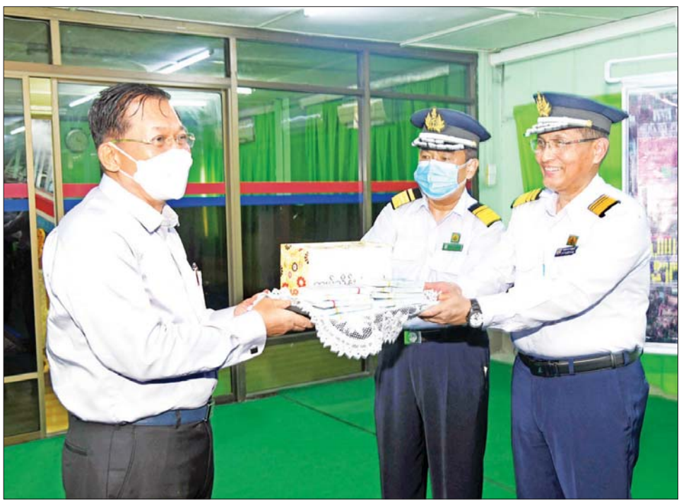
နိုင်ငံတော်စီမံအုပ်ချုပ်ရေးကောင်စီဥက္ကဋ္ဌ နိုင်ငံတော်ဝန်ကြီးချုပ် ဗိုလ်ချုပ်မှူးကြီး မင်းအောင်လှိုင် မီးရထားစက်ခေါင်း စက်ရုံဝန်ထမ်းများအတွက် ချီးမြှင့်ငွေများ ပေးအပ်စဉ်။