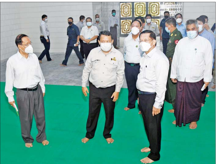
နိုင်ငံတော်စီမံအုပ်ချုပ်ရေးကောင်စီဥက္ကဋ္ဌ နိုင်ငံတော်ဝန်ကြီးချုပ် ဗိုလ်ချုပ်မှူးကြီး မင်းအောင်လှိုင် ဆဋ္ဌသင်္ဂါယနာတင် မဟာပါသာဏ လိုဏ်ဂူသိမ်တော်ကြီး အကြီးစားပြင်ဆင်မှုမိမိခြင်းလုပ်ငန်းများ ဆောင်ရွက်ထားမှုကို ကြည့်ရှုစစ်ဆေးစဉ်။