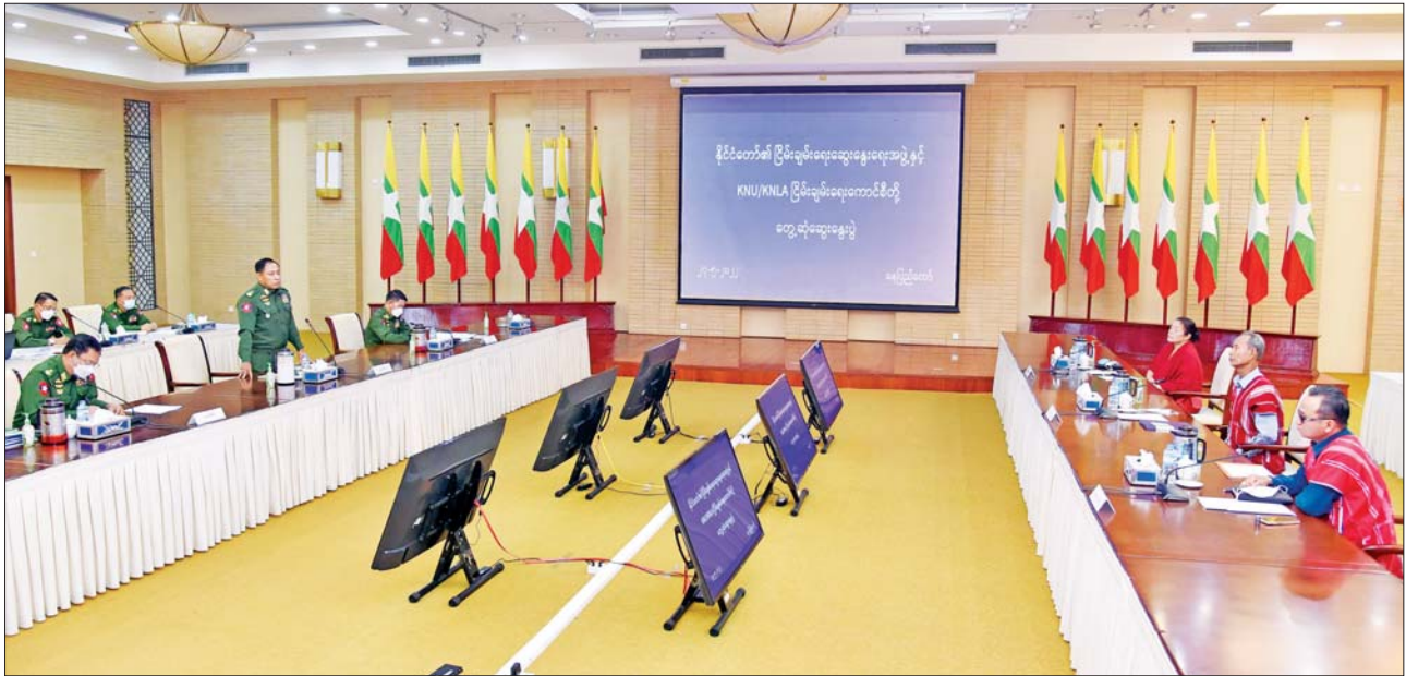
နိုင်ငံတော်၏ငြိမ်းချမ်းရေးဆွေးနွေးရေးအဖွဲ့နှင့် ကရင်အမျိုးသားအစည်းအရုံး၊ ကရင်အမျိုးသားလွတ်မြောက်ရေးတပ်မတော် (ငြိမ်းချမ်းရေး ကောင်စီ) KNU/KNLA (PC) ဥက္ကဋ္ဌ ဦးဆောင်သော ကိုယ်စားလှယ်အဖွဲ့တို့ တွေ့ဆုံဆွေးနွေးပွဲ။

နေပြည်တော် မေ ၂၇ နိုင်ငံတော်၏ ငြိမ်းချမ်းရေးဆွေးနွေးရေးအဖွဲ့နှင့် ကရင်အမျိုးသား အစည်းအရုံး၊ ကရင်အမျိုးသားလွတ်မြောက်ရေးတပ်မတော် (ငြိမ်းချမ်း ရေးကောင်စီ) KNU/KNLA (PC) ဥက္ကဋ္ဌ ဦးဆောင်သော ကိုယ်စားလှယ် အဖွဲ့တို့ တွေ့ဆုံဆွေးနွေးပွဲကို ယနေ့နံနက်ပိုင်းတွင် နေပြည်တော်ရှိ အမျိုးသားစည်းလုံးညီညွတ်ရေးနှင့် ငြိမ်းချမ်းရေးဖော်ဆောင်မှု ဗဟိုဌာန အစည်းအဝေးခန်းမ၌ ကျင်းပသည်။ တွေ့ဆုံဆွေးနွေးပွဲသို့ နိုင်ငံတော်စီမံအုပ်ချုပ်ရေးကောင်စီအဖွဲ့ဝင်၊ အမျိုးသားစည်းလုံးညီညွတ်ရေးနှင့် ငြိမ်းချမ်းရေးဖော်ဆောင်မှု ညှိနှိုင်း ရေးကော်မတီဥက္ကဋ္ဌ၊ ပြည်ထောင်စုအစိုးရအဖွဲ့ရုံးဝန်ကြီးဌာန (၁) ပြည်ထောင်စုဝန်ကြီး၊ ငြိမ်းချမ်းရေးဆွေးနွေးရေးအဖွဲ့ ခေါင်းဆောင် ဒုတိယဗိုလ်ချုပ်ကြီး ရာပြည့်၊ အဖွဲ့ဝင်များဖြစ်ကြသည့် နိုင်ငံတော် စီမံအုပ်ချုပ်ရေးကောင်စီအဖွဲ့ဝင် ဒုတိယဗိုလ်ချုပ်ကြီး မိုးမြင့်ထွန်း၊ အမျိုးသားစည်းလုံးညီညွတ်ရေးနှင့် ငြိမ်းချမ်းရေးဖော်ဆောင်မှု ညှိနှိုင်းရေးကော်မတီ အတွင်းရေးမှူး ဒုတိယဗိုလ်ချုပ်ကြီး မင်းနောင် နှင့် KNU/KNLA (PC) မှ ဥက္ကဋ္ဌ စောထွေးလေး၊ ဒုတိယဥက္ကဋ္ဌ ဒေါက်တာ နော်ကပေါ်ထူး၊ စာမျက်နှာ ၁၀ ကော်လံ ၁