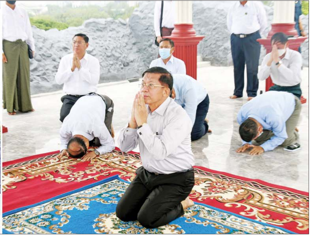
နိုင်ငံတော်စီမံအုပ်ချုပ်ရေးကောင်စီဥက္ကဋ္ဌ နိုင်ငံတော်ဝန်ကြီးချုပ် ဗိုလ်ချုပ်မှူးကြီး မင်းအောင်လှိုင် မဟာပါသာဏလိုဏ်ဂူတော်ကြီး၏ အပေါ်ဆုံးထပ်ရှိ ဗုဒ္ဓရုပ်ပွားတော်မြတ်အား ဖူးမြော်ကြည့်ညှိစဉ်။