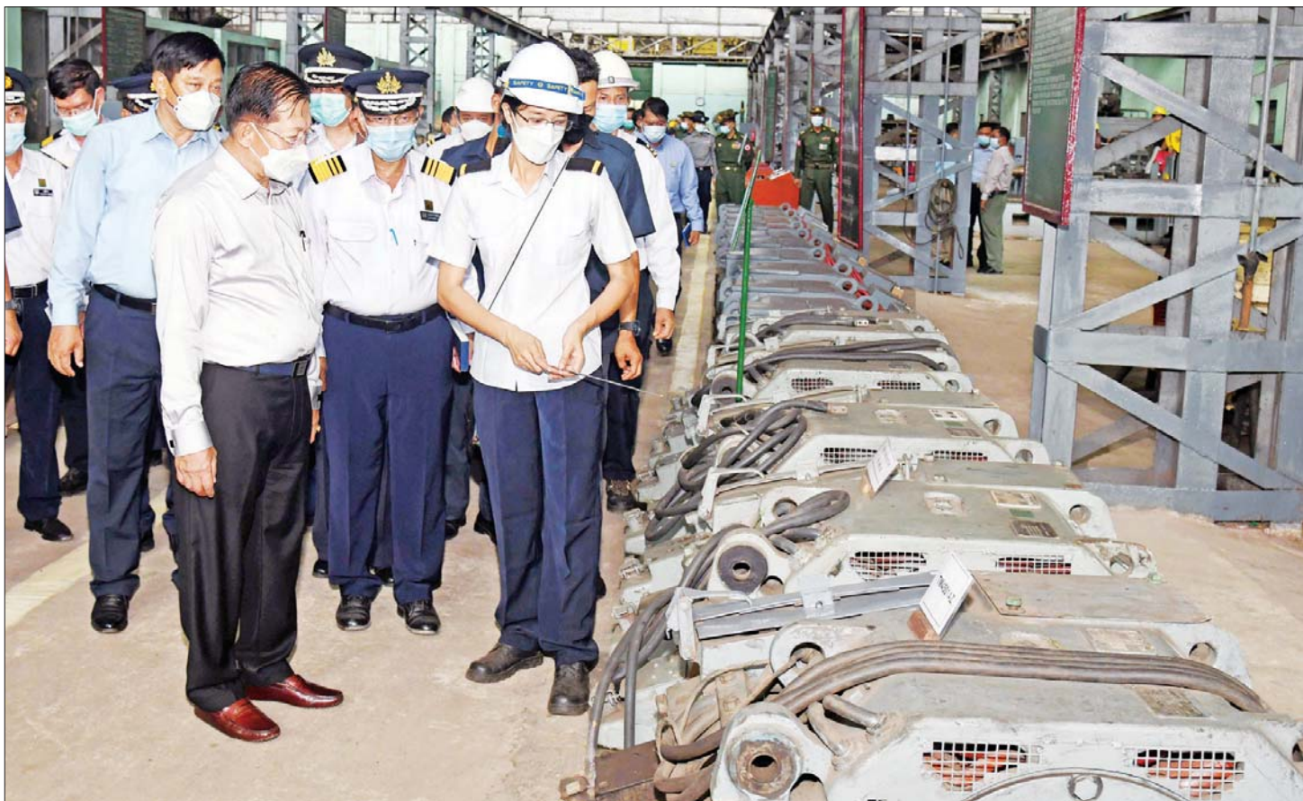
နိုင်ငံတော်စီမံအုပ်ချုပ်ရေးကောင်စီဥက္ကဋ္ဌ နိုင်ငံတော်ဝန်ကြီးချုပ် ဗိုလ်ချုပ်မှူးကြီး မင်းအောင်လှိုင် မြန်မာ့မီးရထား၊ စက်ခေါင်းစက်ရုံ (အင်းစိန်) အတွင်း ကြည့်ရှုစစ်ဆေးစဉ်။