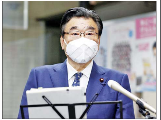
ဂျပန်ကျန်းမာရေးဝန်ကြီး ရှိဂီယူကီ ဂိုတို။

ဂျပန်ကျန်းမာရေးဝန်ကြီးက ဂျပန်နိုင်ငံတွင် ပြည်တွင်းထုတ်ရေကျောက်ရောဂါ ကာကွယ်ဆေးအမြောက်အမြားရှိကြောင်း ထပ်မံပြောကြားလိုက်သည်။ ဆင်ဟွာ