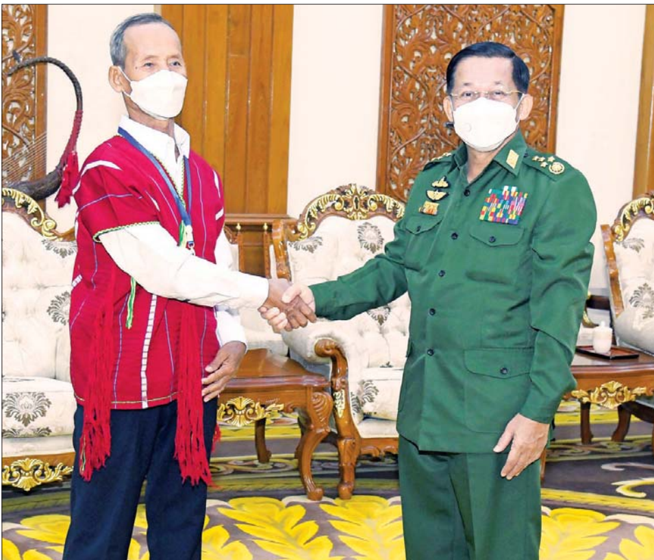
နိုင်ငံတော်စီမံအုပ်ချုပ်ရေးကောင်စီဥက္ကဋ္ဌ တပ်မတော်ကာကွယ်ရေးဦးစီးချုပ် ဗိုလ်ချုပ်မှူးကြီး မင်းအောင်လှိုင် ကရင်အမျိုးသားအစည်းအရုံး၊ ကရင်အမျိုးသားလွတ်မြောက်ရေးတပ်မတော် (ငြိမ်းချမ်းရေး ကောင်စီ) KNU/KNLA(PC) ဥက္ကဋ္ဌ စောထွေးလေးအား ရင်းရင်းနှီးနှီး နှုတ်ဆက်စဉ်။

လက်တွေ့ကျကျ အကောင်အထည်ဖော် ထိုသို့ တွေ့ဆုံဆွေးနွေးရာတွင် တိုင်းဒေသကြီး နှင့်ပြည်နယ်တိုင်း၌ တိုင်းရင်းသားလူမျိုးတစ်ခုတည်း သာ သီးသန့်နေထိုင်သည်မဟုတ်ဘဲ တိုင်းရင်းသား ပေါင်းစုံ အတူတကွပေါင်းစည်းနေထိုင်သည့် ပြည်ထောင်စုနိုင်ငံဖြစ်သည့်အတွက် ပြည်ထောင်စု အကျိုးကိုကြည့်၍ ဆောင်ရွက်သွားကြမည့် အခြေ အနေ၊ ငြိမ်းချမ်းရေးရရှိမှသာလျှင် နိုင်ငံတည်ဆောက် ရေး(State Building)၊ တိုင်းပြည်တည်ဆောက်ရေး (Nation Building)ကို ပိုမိုသွက်လက်စွာ ဆောင်ရွက် နိုင်မည်ဖြစ်သည့်အတွက် မိမိတိုင်းရင်းသား၊ မိမိ ပြည်နယ်နှင့် မိမိတိုင်းပြည်ဖွံ့ဖြိုးတိုးတက်ရေးကို ဦးတည်စဉ်းစားဆောင်ရွက်ရန် လိုသည့်အခြေအနေ၊ ဒီမိုကရေစီစနစ်ကို ဖော်ဆောင်ရာတွင် အသိပညာ၊ အတတ်ပညာနှင့် ပြည့်စုံသည့် လူသားအရင်းအမြစ် များ ပေါ်ထွက်လာရန် အဓိကလိုအပ်သည့်အတွက် တစ်နိုင်လုံး တိုင်းရင်းသားဒေသများပါမကျန် ပညာရည်မြှင့်တင်ရေးကို လက်တွေ့ကျကျ အကောင် အထည်ဖော် ဆောင်ရွက်လျက်ရှိသည့် အခြေအနေ၊