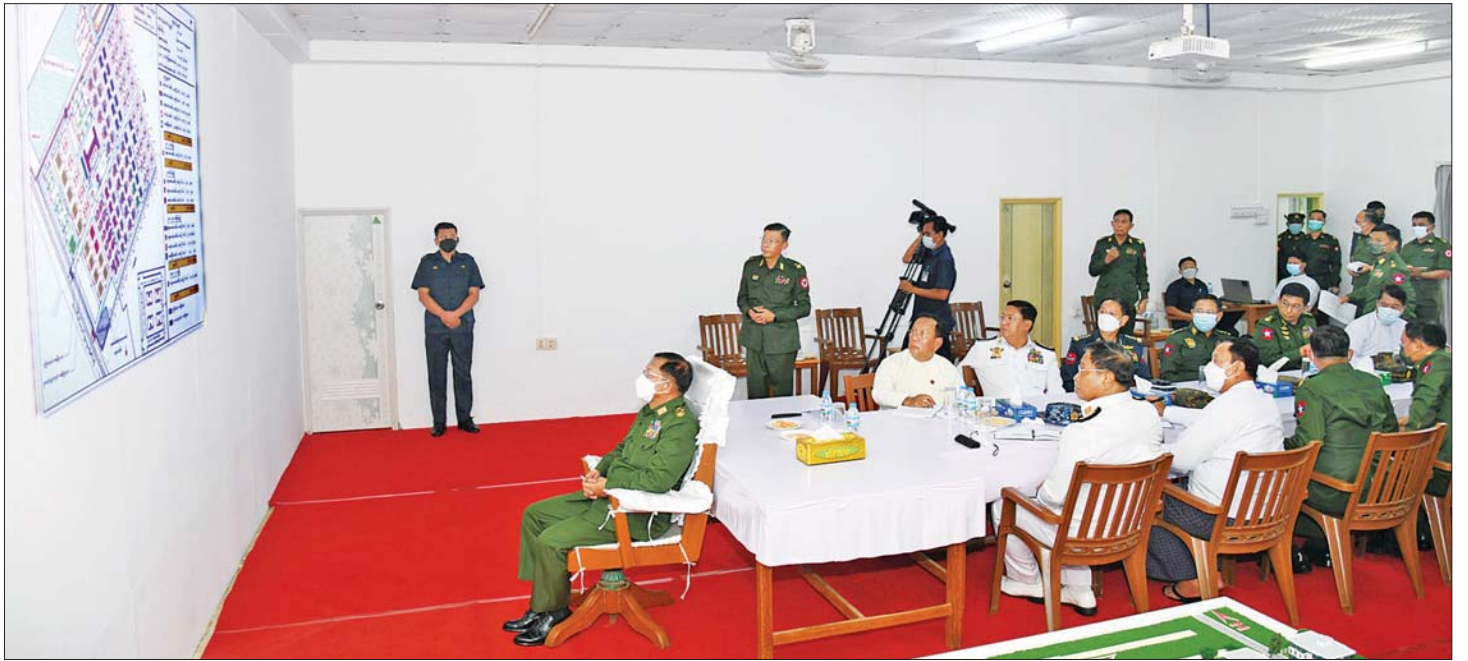
နိုင်ငံတော်စီမံအုပ်ချုပ်ရေးကောင်စီဥက္ကဋ္ဌ တပ်မတော်ကာကွယ်ရေးဦးစီးချုပ် ဗိုလ်ချုပ်မှူးကြီး မင်းအောင်လှိုင်အား မြန်မာ့သားကောင်း စစ်မှုထမ်းဟောင်း အိမ်ရာ (လေးထောင့်ကန်) တည်ဆောက်နေမှု အခြေအနေများကို တာဝန်ရှိသူတစ်ဦးက ရှင်းလင်းတင်ပြစဉ်။

နိုင်ငံတော်စီမံအုပ်ချုပ်ရေးကောင်စီဥက္ကဋ္ဌ တပ်မတော် ကာကွယ်ရေးဦးစီးချုပ် ဗိုလ်ချုပ်မှူးကြီး မင်းအောင်လှိုင်သည် ကောင်စီဝင် ဗိုလ်ချုပ်ကြီး တင်အောင်စန်း၊ ကောင်စီတွဲဖက်အတွင်းရေးမှူး ဒုတိယဗိုလ်ချုပ်ကြီး ရဲဝင်းဦး၊ သမဝါယမနှင့် ကျေးလက်ဖွံ့ဖြိုးရေးဝန်ကြီးဌာန ပြည်ထောင်စု ဝန်ကြီး ဦးလှမိုး၊ ရန်ကုန်တိုင်းဒေသကြီး ဝန်ကြီးချုပ် ဦးစိုးသိန်း၊ ကာကွယ်ရေးဦးစီးချုပ်(ရေ) ဗိုလ်ချုပ်ကြီး မိုးအောင်၊ ကာကွယ်ရေးဦးစီးချုပ်(လေ)ဗိုလ်ချုပ်ကြီး ထွန်းအောင်၊ ကာကွယ်ရေးဦးစီးချုပ်ရုံးမှ တပ်မတော် အရာရှိကြီးများ၊ မြန်မာနိုင်ငံ စစ်မှုထမ်းဟောင်းအဖွဲ့ ဒုတိယဥက္ကဋ္ဌ ဒုတိယဗိုလ်ချုပ်ကြီး ရဲအောင်၊ ရန်ကုန် တိုင်းစစ်ဌာနချုပ်တိုင်းမှူး ဗိုလ်ချုပ် ညွှန်ဝင်းဆွေ၊ မြို့တော်ဝန် ဦးဘိုဌေးနှင့် တာဝန်ရှိသူများလိုက်ပါ၍ ယနေ့ညနေပိုင်းတွင် ရန်ကုန်တိုင်းဒေသကြီး ဒဂုံမြို့သစ်(တောင်ပိုင်း)မြို့နယ်ရှိမြန်မာ့သားကောင်း စစ်မှုထမ်းဟောင်းအိမ်ရာ (လေးထောင့်ကန်) တည်ဆောက်နေမှု အခြေအနေများကို သွားရောက် ကြည့်ရှုစစ်ဆေးသည်။