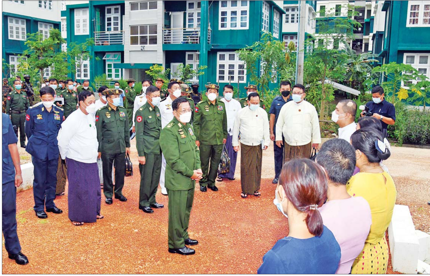
နိုင်ငံတော်စီမံအုပ်ချုပ်ရေးကောင်စီဥက္ကဋ္ဌ တပ်မတော်ကာကွယ်ရေးဦးစီးချုပ် ဗိုလ်ချုပ်မှူးကြီး မင်းအောင်လှိုင်နှင့် အဖွဲ့ဝင်များ စစ်မှုထမ်းဟောင်းအိမ်ရာ အတွင်း နေထိုင်လျက်ရှိသည့် စစ်မှုထမ်းဟောင်းများနှင့် မိသားစုဝင်များအား ရင်းရင်းနှီးနှီး လိုက်လံနှုတ်ဆက်စဉ်။