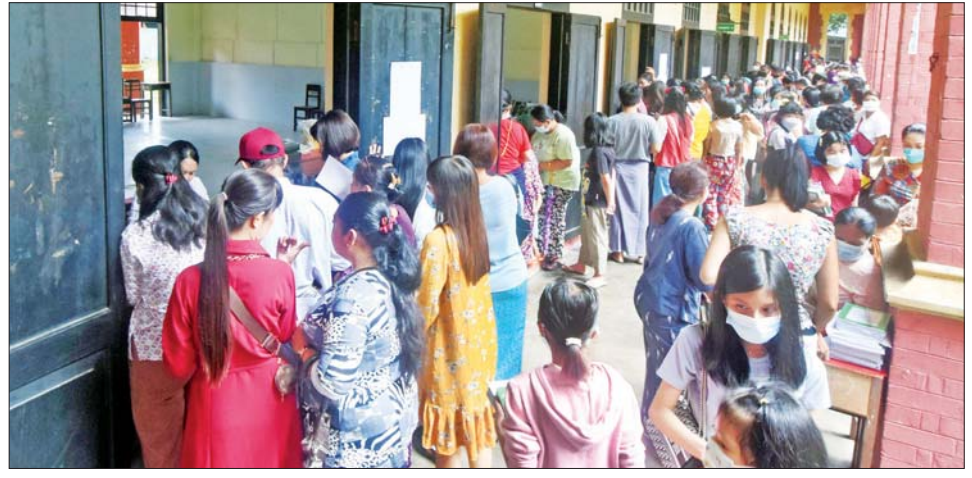
ရန်ကုန်တိုင်းဒေသကြီး လသာမြို့နယ် အမှတ်(၂) အခြေခံပညာ အထက်တန်းကျောင်း(လသာ)၌ ကျောင်းအပ်နှံရေးနှင့် မိဘအုပ်ထိန်းသူများ လာရောက်ကျောင်းအပ်နှံမှုကို တွေ့ရစဉ်။

“ကျောင်းအပ်နှံရေးသီတင်းပတ်ကို ပညာရေး ဝန်ကြီးဌာနက သတ်မှတ်ထားတဲ့အတိုင်း ကျောင်း တိုင်း လက်ခံကြပါတယ်။ ဒီနှစ်ကျောင်းအပ်နှံရေး ဆောင်ပုဒ်ကတော့ ကျောင်းနေအရွယ် ကလေး အားလုံး ပညာသင်ယူခွင့် ရရှိဖို့၊ ကျောင်းအပ်နှံကြဖို့ ဖြစ်ပါတယ်။ နှစ်တိုင်း ကျောင်းသားဟောင်းရော၊ ကျောင်းသားသစ်ရောက်ခံပါတယ်။ ကျောင်းနေ အရွယ်ကလေးတိုင်း ကျောင်းသို့ရောက်ရှိရေး အတွက်ဆိုတဲ့အတိုင်း ပညာရေးဝန်ကြီးဌာနက ဝန်ထမ်းအားလုံး၊ ကျောင်းသားတွေအားလုံးကို လက်ခံပါတယ်။ ဒီနှစ်ဆို ၂၀၁၉-၂၀၂၀ ပြည့်နှစ်မှာ အကြောင်းအမျိုးမျိုးကြောင့် ကျောင်းမတက်ဖြစ်တဲ့ ကျောင်းသားအားလုံးလက်ခံပါတယ်။ ကျောင်းသား အသစ်တွေကိုလည်း လက်ခံပါတယ်။ ကျွန်မတို့ ကျောင်းက မိန်းကလေး ကျောင်းဖြစ်တဲ့အတွက် ပစ္စမတန်းအထိကို ယောက်ျားလေးလက်ခံပြီး Grade-6 မှ Grade-12 အထိ မိန်းကလေးပဲ လက်ခံ ပါတယ်။ ကျောင်းမဖွင့်ခင်ကတည်းက ပညာရေး ဝန်ကြီးဌာနရဲ့ စာမျက်နှာ ၁၉ သို့