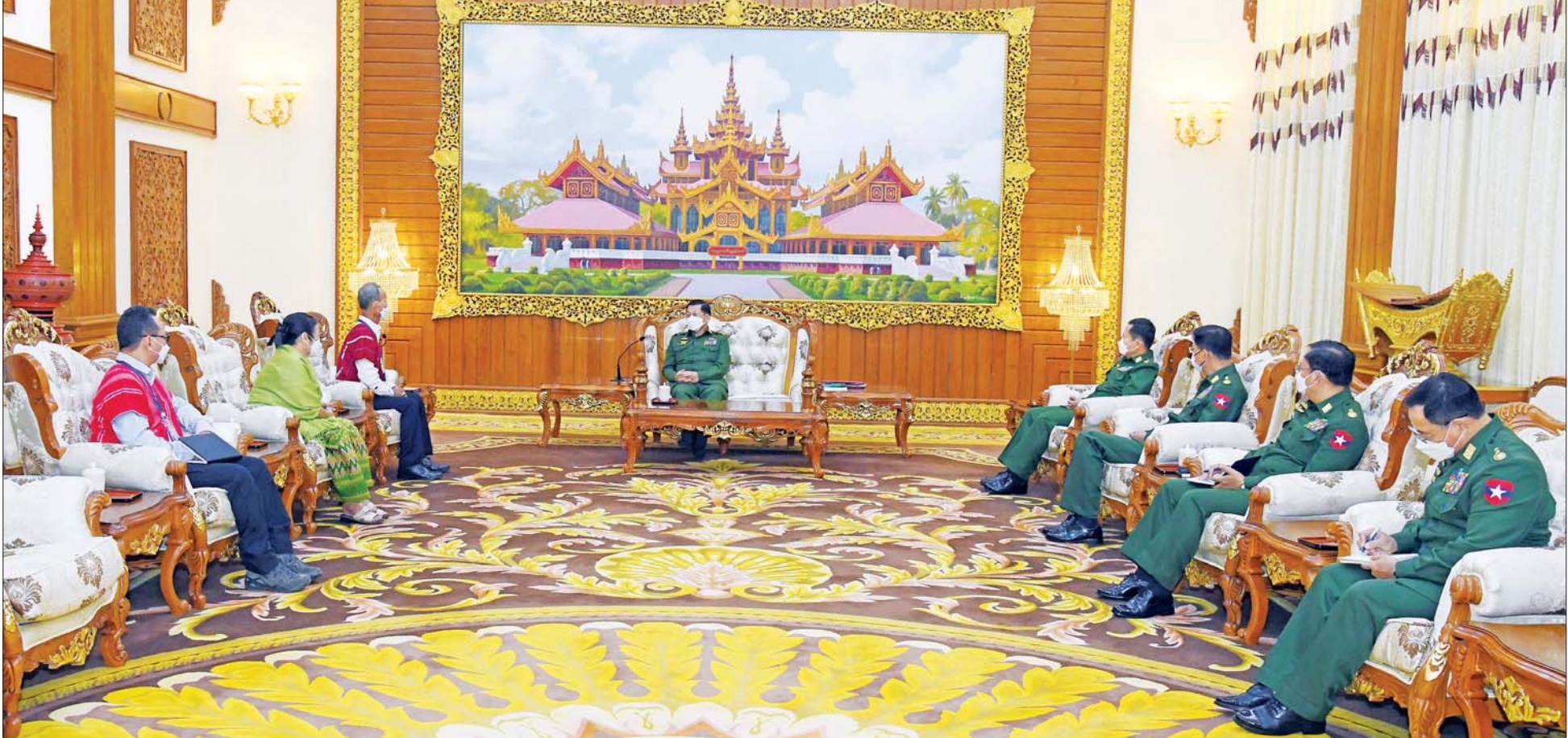
နိုင်ငံတော်စီမံအုပ်ချုပ်ရေးကောင်စီဥက္ကဋ္ဌ တပ်မတော်ကာကွယ်ရေးဦးစီးချုပ် ဗိုလ်ချုပ်မှူးကြီး မင်းအောင်လှိုင် ကရင်အမျိုးသားအစည်းအရုံး၊ ကရင်အမျိုးသားလွတ်မြောက်ရေးတပ်မတော် (ငြိမ်းချမ်းရေးကောင်စီ) KNU/KNLA(PC)မှ ဥက္ကဋ္ဌ စောထွေးလေး ဦးဆောင်သည့် ငြိမ်းချမ်းရေးကိုယ်စားလှယ်အဖွဲ့အား တွေ့ဆုံ၍ ငြိမ်းချမ်းရေးဆိုင်ရာကိစ္စရပ်များ ဆွေးနွေးစဉ်။

နေပြည်တော် မေ ၂၆ ရေးကောင်စီ) KNU/KNLA(PC)မှ ဥက္ကဋ္ဌ စောထွေးလေး ဦးဆောင် အဆိုပါ ငြိမ်းချမ်းရေးတွေ့ဆုံဆွေးနွေးပွဲသို့ နိုင်ငံတော်စီမံအုပ်ချုပ်ရေးကောင်စီဥက္ကဋ္ဌ တပ်မတော်ကာကွယ်ရေးဦးစီးချုပ် ဗိုလ်ချုပ်မှူးကြီး မင်းအောင်လှိုင်သည် ကရင်အမျိုးသားအစည်းအရုံး၊ ကရင်အမျိုးသားလွတ်မြောက်ရေးတပ်မတော် (ငြိမ်းချမ်းရေးကောင်စီ) KNU/KNLA(PC)မှ ဥက္ကဋ္ဌ စောထွေးလေး ဦးဆောင်သည့် ငြိမ်းချမ်းရေးကိုယ်စားလှယ်အဖွဲ့အား ယနေ့နံနက်ပိုင်းတွင် နေပြည်တော်ရှိ ဘုရင့်နောင်ရိပ်သာ ဧည့်ခန်းမဆောင်၌ တွေ့ဆုံ၍ ငြိမ်းချမ်းရေးဆိုင်ရာကိစ္စရပ်များ ဆွေးနွေးသည်။