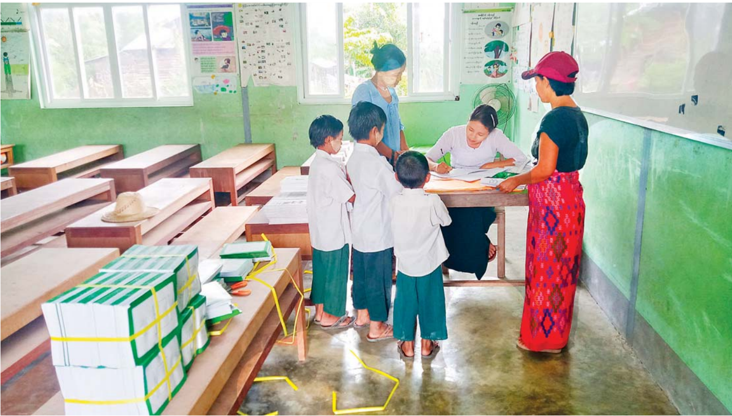
အိမ်မဲမြို့နယ်အတွင်း အခြေခံပညာကျောင်းတစ်ကျောင်း၌ ကျောင်းသား ကျောင်းသူလေးများ ကျောင်းအပ်နေစဉ်။

နေ့ခင်းဘက်ဖြစ်၍ ဆိုင်အတွင်း လူကျဲသည်။ လက်ဖက်ရည်တစ်ခွက်မှာပြီး စားပွဲ အလွတ်လေး တစ်ခုတွင် ထိုင်ရင်း မိုးအစဲကို စောင့်နေမိသည်။ မိုးကတော်တော်နှင့် မစဲနိုင်ပါ။ ရှေ့တူရွာရာအရပ်မှ မူလတန်းကျောင်း လေးတစ်ကျောင်းက မြင်ကွင်း အတွင်း တိုးဝင်လာသည်။ ယခင်က အမှုမဲ့အမှတ်မဲ့။ ယခု စေ့စေ့စပ်စပ်ကြည့်လိုက်မိတော့ လေးဘက် လေးတန်အုတ်တံတိုင်းများ၊ ထပ်တိုးကျောင်းဆောင် သစ် အချို့မှလွဲ၍ ကျောင်းကလေး၏ ဥပမိကား ဘာမျှ သိသိသာသာ ပြောင်းလဲမသွား။ ကိုယ်တွေ ငယ်စဉ်က စတင်ပညာသင်ကြားခဲ့ရာ စာသင်ဆောင် လေးကလည်း ပြကတော့အတိုင်းပင်။