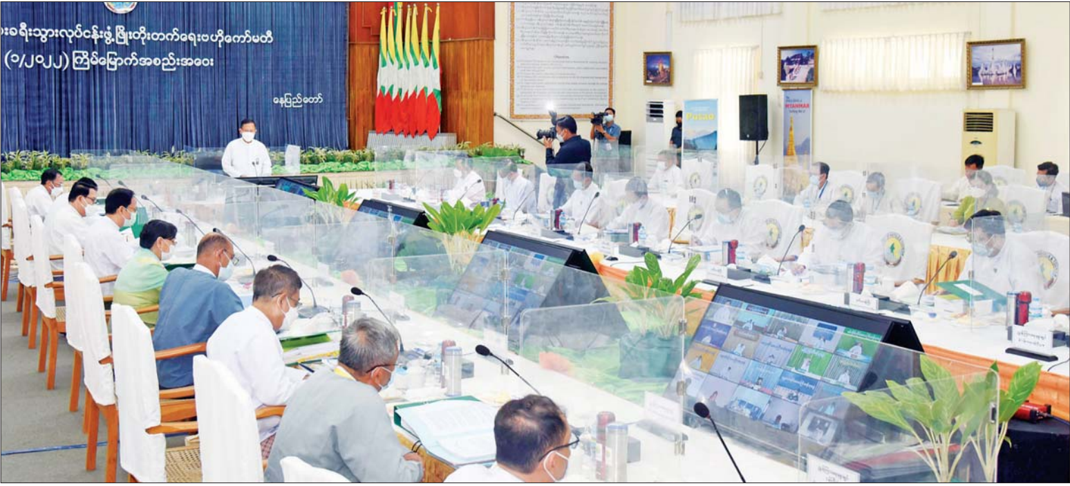
နိုင်ငံတော်စီမံအုပ်ချုပ်ရေးကောင်စီ ဒုတိယဥက္ကဋ္ဌ ဒုတိယဝန်ကြီးချုပ် ဒုတိယဗိုလ်ချုပ်မှူးကြီး စိုးဝင်း အမျိုးသားခရီးသွားလုပ်ငန်း ဖွံ့ဖြိုးတိုးတက်ရေးဗဟိုကော်မတီ အစည်းအဝေး (၁/၂၀၂၂) တွင် အမှာစကားပြောကြားစဉ်။

နေပြည်တော် မေ ၂၆ အမျိုးသားခရီးသွားလုပ်ငန်း ဖွံ့ဖြိုး တိုးတက်ရေးဗဟိုကော်မတီ အစည်း အဝေး (၁/၂၀၂၂)ကို ယနေ့ မွန်းလွဲ ၂ နာရီတွင် နေပြည်တော်ရှိ ဟိုတယ်နှင့် ခရီးသွားလာရေးဝန်ကြီးဌာန ကျောက် စိမ်းခန်းမ၌ကျင်းပရာ အမျိုးသားခရီး သွားလုပ်ငန်း ဖွံ့ဖြိုးတိုးတက်ရေးဗဟို ကော်မတီဥက္ကဋ္ဌ နိုင်ငံတော်စီမံအုပ်ချုပ် ရေးကောင်စီ ဒုတိယဥက္ကဋ္ဌ ဒုတိယ ဝန်ကြီးချုပ် ဒုတိယဗိုလ်ချုပ်မှူးကြီး စိုးဝင်း တက်ရောက်အမှာစကား ပြောကြားသည်။ အစည်းအဝေးသို့ ပြည်ထောင်စု ဝန်ကြီးများ၊ နေပြည်တော်ကောင်စီဥက္ကဋ္ဌ၊ ဒုတိယဝန်ကြီးများနှင့် တာဝန်ရှိသူများ တက်ရောက်ကြပြီး တိုင်းဒေသကြီးနှင့် ပြည်နယ်ဝန်ကြီးချုပ်များ၊ ခရီးသွား လုပ်ငန်းဆိုင်ရာ တတ်သိပညာရှင်များ၊ စာမျက်နှာ ၆ ကော်လံ ၁ ◆