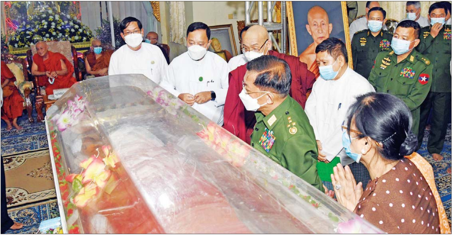
နိုင်ငံတော်စီမံအုပ်ချုပ်ရေးကောင်စီဥက္ကဋ္ဌ နိုင်ငံတော်ဝန်ကြီးချုပ် ဗိုလ်ချုပ်မှူးကြီး မင်းအောင်လှိုင်နှင့် ဇနီးဒေါ်ကြူကြူလှ နိုင်ငံတော်ဩဝါဒါစရိယ ရွှေသုဝဏ် ဆရာတော်ဘုရားကြီး၏ ဥတုဇရုပ်ကလာပ်တော်အား ဖူးမြော်ကြည်ညိုစဉ်။

သွားရောက်ဖူးမြော်ကြည်ညို ဆရာတော်ဘုရားကြီး၏ ဥတုဇရုပ်ကလာပ်တော် အား ပုညနိမ္မိတာရာမ ရွှေသုဝဏ်ကျောင်းတိုက်၌ ပူဇော်ထားလျက်ရှိရာ နိုင်ငံတော်စီမံအုပ်ချုပ်ရေး ကောင်စီဥက္ကဋ္ဌ နိုင်ငံတော်ဝန်ကြီးချုပ် ဗိုလ်ချုပ်မှူးကြီး မင်းအောင်လှိုင်နှင့် ဇနီး ဒေါ်ကြူကြူလှ တို့သည် ကောင်စီဝင် ဗိုလ်ချုပ်ကြီး တင်အောင်စန်း နှင့်ဇနီး၊ တွဲဖက်အတွင်းရေးမှူး ဒုတိယဗိုလ်ချုပ်ကြီး ရဲဝင်းဦး၊ သာသနာရေးနှင့် ယဉ်ကျေးမှုဝန်ကြီးဌာန ပြည်ထောင်စုဝန်ကြီး ဦးကိုကို၊ သမဝါယမနှင့် ကျေးလက်ဖွံ့ဖြိုးရေးဝန်ကြီးဌာန ပြည်ထောင်စု ဝန်ကြီး ဦးလှမိုး၊ ရန်ကုန်တိုင်းဒေသကြီး ဝန်ကြီးချုပ် ဦးစိုးသိန်း၊ ကာကွယ်ရေးဦးစီးချုပ်(ရေ) ဗိုလ်ချုပ်ကြီး