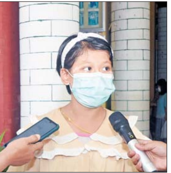
အ.ထ.က (၂)လသာ Grade -4 မှ ကျောင်းသူတစ်ဦး

“ကျောင်းအပ်နှံရေး ရက်သတ္တပတ်ကာလအနေနဲ့ မေ ၂၆ ရက်ကနေ ဇွန် ၁ ရက်နေ့အထိ ဖြစ်ပါတယ်။ ကျွန်မတို့ကျောင်းက မနက် ၈ နာရီကနေ မွန်းလွဲ ၂ နာရီ အထိ လက်ခံပါတယ်။ ကျောင်းလာရောက် အပ်နှံမယ်ဆိုရင် ကျောင်းသားကျောင်းသူနဲ့အတူ မိဘအုပ်ထိန်းသူပါမှသာ ကျောင်းအပ်လက်ခံပါတယ်။ KG နဲ့ Grade 1 ကျောင်းသား ကျောင်းသူတွေဆိုရင် မိဘနှစ်ပါးရဲ့ မှတ်ပုံတင်မူရင်း၊ မိတ္တူရယ် ရုပ်ကွက် နေထိုင်ကြောင်း သန်းခေါင်စာရင်း မိတ္တူ၊ မူရင်း ပါရှိရပါမယ်။ ကျောင်းလာရောက်အပ်နှံတယ်ဆိုရင် ကလေးတိုင်းကို ပုံနှိပ်စာအုပ်ရယ်၊ ဗလာစာအုပ်ရယ်၊ ကိုဗစ်ကာကွယ်ရေးပစ္စည်းတွေကို အခမဲ့ပေးသွား မှာဖြစ်တယ်။ မူလတန်းအတွက် ထောက်ပံ့ပေးတဲ့ ကျောင်းဝတ်စုံကိုလည်း ကျောင်းဖွင့်ချိန်ကာလ အတွင်း ထောက်ပံ့ပေးသွားမှာဖြစ်ပါတယ်။ မနက်က အကြောင်းအမျိုးမျိုးကြောင့် ကျောင်းမတက်ဖြစ်တဲ့ ကလေးတွေဆိုရင် နဂိုမူရင်းအတန်းကို သွားရောက် အပ်နှံရမှာဖြစ်ပါတယ်။ နောက်တစ်ခုက ၂၀၁၉-၂၀၂၀ မှာ Grade-5 စတုတ္ထတန်း အောင်ထားတဲ့သူ ဆိုရင် Grade-6 မှာ သွားရောက်သင်ကြားရမှာ ဖြစ်ပါတယ်။ ၂၀၁၉-၂၀၂၀ မှာ နဝမတန်းအောင် ထားတဲ့ ကျောင်းသား ကျောင်းသူဆိုရင် စနစ်သစ် Grade -11 မှာ တက်ရောက်ခွင့်ရှိတယ်။ Grade-11 ပြင်ပဖြေစနစ်ဟောင်းကိုလည်း ရွေးချယ်ခွင့်ရှိတယ်။ ၂၀၂၂-၂၀၂၃ ပညာသင်နှစ်မှာ ပညာရေးဝန်ကြီးဌာနရဲ့ “ကျောင်းနေအရွယ်ကလေးအားလုံး ပညာသင်ခွင့် ရရှိဖို့ ကျောင်းအပ်နှံကြပါစို့” ဆောင်ပုဒ်နဲ့အညီ မိဘတွေအနေနဲ့ မိမိတို့ရဲ့ ကလေးတွေကို ကျောင်း လာရောက်အပ်နှံကြဖို့မိတ်ခေါ်ပါတယ်”ဟု ပြော သည်။