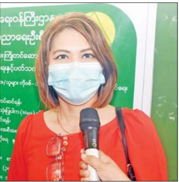
အ.ထ.က (၂)လသာ Grade-(10)မှ မိဘတစ်ဦး