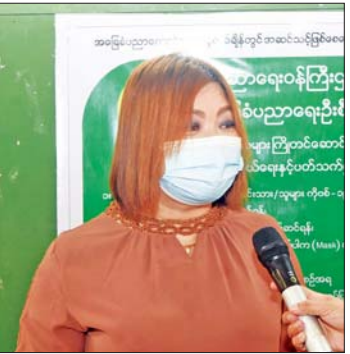
အ.ထ.က (၂)လသာ Grade - 4 နှင့် 7 မှ မိဘတစ်ဦး