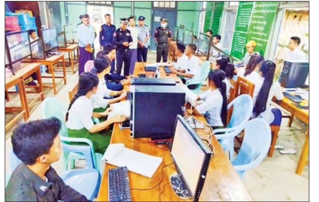
များ ပြည့်စုံမှန်ကန်စေရေးအတွက် နိုင်ငံ-၄ မှတ်တမ်းများ Excel Format ရေးသွင်းနေမှုနှင့် e-ID စနစ် Software ရေးသွင်းမှု ပြီးစီးရေး အလေး ထားဆောင်ရွက်ရန်တို့ကို ဆွေးနွေးပြောကြားသည်။

မကွေးတိုင်းဒေသကြီး လူမှုရေးရာဝန်ကြီး ဦးစိုးပိုင်မြင့်သည် မေ ၂၆ ရက် မွန်းလွဲပိုင်းက ဆင်ပေါင်ဝဲမြို့နယ် မြို့နယ်အထွေထွေအုပ်ချုပ် ရေးဦးစီးဌာန၌ နိုင်ငံသားစိစစ်ရေးကတ် ထုတ်ပေးမှုမှတ်တမ်းကို e-ID စနစ်ဖြင့် Data ဖြည့်သွင်းဆောင်ရွက်နေမှု အခြေအနေများကို ကြည့်ရှုစစ်ဆေးသည်။ (ယာပုံ)