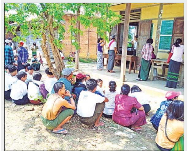
စေတုတ္တရာမြို့နယ်၌ ကျောင်းအပ်နှံရေးနေ့ သီတင်းပတ်အဖြစ် ယနေ့နံနက်က ကျောင်းသား ကျောင်းသူများအား ကျောင်းအပ် လက်ခံစဉ်။ မြို့နယ်(ပြန်/ဆက်)

ကန့်ဘလူ စစ်ကိုင်းတိုင်းဒေသကြီး ကန့်ဘလူမြို့ပေါ်ရှိ အခြေခံပညာကျောင်းများ ဖြစ်သော အထက (၁)၊ အထက (၂)၊ အထက (ခွဲ) ညောင်အိုင်၊ အလက(၅)၊ အလက(၁)၊ အမက(၂)၊ မူလွန်ကျောင်းနှင့် အမက (၄) ကျောင်းများတွင် မေ ၂၆ ရက်နံနက်မှစ၍ စတင်ကျောင်းအပ်လက်ခံ လျက်ရှိကာ ကျောင်းအပ်နှံရေးသီတင်းပတ်ဖြစ်သည့် မေ ၂၆ ရက်မှ ဇွန် ၁ ရက်အထိ နေ့စဉ်နံနက် ၉ နာရီမှ ၁၂ နာရီအထိ ကျောင်းအပ်နှံရေး လုပ်ငန်းများ ဆောင်ရွက်သွားမည်ဖြစ်ကြောင်းနှင့် အခြေခံပညာ ကျောင်းများကို ဇွန် ၂ ရက်တွင် ဖွင့်လှစ်မည်ဖြစ်ကြောင်း မြို့နယ်ပညာ ရေးမှူးရုံးမှ သိရသည်။ အောင်ဝင်းငြိမ်း(ကန့်ဘလူ)