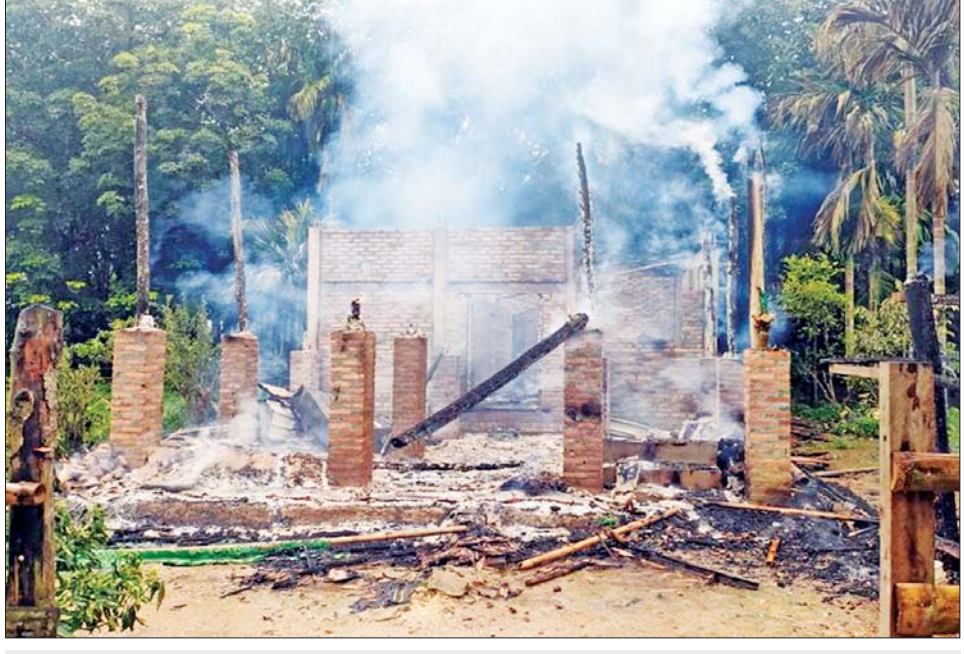
အကြမ်းဖက်သမားများက မီးရှို့ဖျက်ဆီးထားသည့် ပြည်သူ့စစ် တပ်ဖွဲ့ဝင်များ၏ နေအိမ်များ။

ဖက်သမား အင်အား ၅၀ ခန့်က လက်နက်ကြီး/ လက်နက်ငယ်များဖြင့် စတင်ပစ်ခတ်တိုက်ခိုက်သဖြင့် ပူးပေါင်းအဖွဲ့က ပြန်လည်ပစ်ခတ်ခဲ့ရာ အကြမ်းဖက် သမားများသည် အရှေ့မြောက်ဘက်သို့ ဆုတ်ခွာ ထွက်ပြေးသွားခဲ့ကြောင်း သိရသည်။ အဆိုပါ နေအိမ်များကို မီးရှို့ဖျက်ဆီးခဲ့သည့် အကြမ်းဖက်သမားများ ဆုတ်ခွာထွက်ပြေးသွားသည့် နေရာများသို့ လုံခြုံရေးတပ်ဖွဲ့ဝင်များနှင့် ပြည်သူ့စစ် တပ်ဖွဲ့ဝင်များပါဝင်သော ပူးပေါင်းအဖွဲ့က လိုက်လံ ၍ အကြမ်းဖက်နှိမ်နင်းရေးနှင့် လုံခြုံရေးလုပ်ငန်းများ ဆောင်ရွက်လျက်ရှိကြောင်း သတင်းရရှိသည်။ သတင်းစဉ်