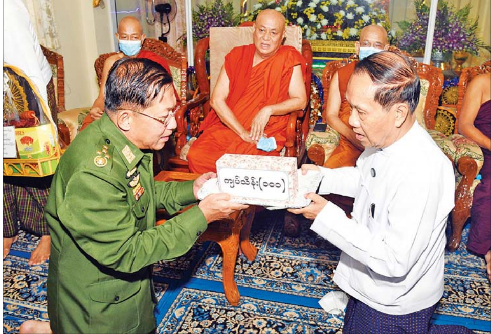
နိုင်ငံတော်စီမံအုပ်ချုပ်ရေးကောင်စီဥက္ကဋ္ဌ နိုင်ငံတော်ဝန်ကြီးချုပ် ဗိုလ်ချုပ်မှူးကြီး မင်းအောင်လှိုင် ဆရာတော်ဘုရားကြီး၏ အန္တိမအဂ္ဂိဈာပနပူဇာသဘင် အခမ်းအနားကျင်းပပြုလုပ်နိုင်ရေး အလှူငွေများ ပေးအပ်လှူဒါန်းစဉ်။

မိုးအောင်၊ ကာကွယ်ရေးဦးစီးချုပ်(လေ) ဗိုလ်ချုပ်ကြီး ထွန်းအောင်၊ ကာကွယ်ရေးဦးစီးချုပ်ရုံးမှ တပ်မတော် အရာရှိကြီးများ၊ ရန်ကုန်တိုင်းစစ်ဌာနချုပ် တိုင်းမှူး နှင့် တာဝန်ရှိသူများလိုက်ပါ၍ ယနေ့မုန့်လွှဲပိုင်းတွင် သွားရောက်ဖူးမြော်ကြည်ညိုသည်။