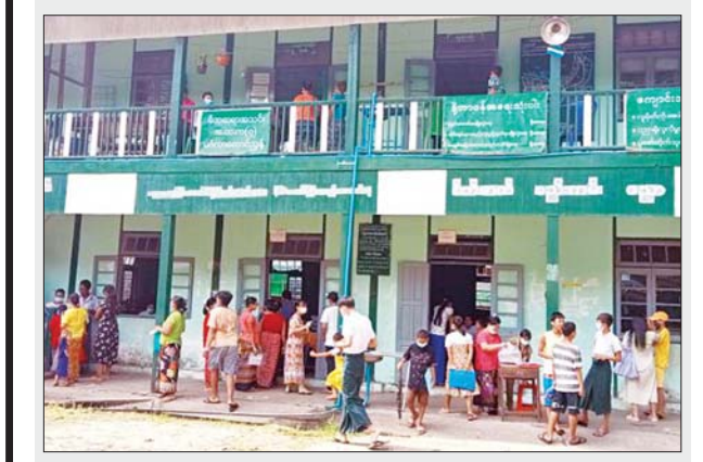
ရန်ကုန်တိုင်းဒေသကြီး မင်္ဂလာတောင်ညွန့်မြို့နယ် အမှတ်(၇) အခြေခံပညာအထက်တန်းကျောင်း၌ မေ ၂၆ ရက်က မိဘအုပ်ထိန်း သူများ ကျောင်းအပ်နှံနေစဉ်။

ကျောင်းအပ်နှံရေးနေ့ အခမ်းအနားတွင် မြို့နယ်စီမံအုပ်ချုပ်ရေး အဖွဲ့ဥက္ကဋ္ဌ ဦးကျော်ဘုန်းမောင်က အမှာစကားပြောကြားသည်။ ထို့နောက် မြို့နယ်ပညာရေးမှူးနှင့် တာဝန်ရှိသူများက မြို့နယ် အတွင်းရှိ ကျောင်းအသီးသီးအတွက် နိုင်ငံတော်မှ အခမဲ့ထောက်ပံ့ ပေးသော ပုံနှိပ်စာအုပ်၊ ဗလာစာအုပ်၊ ခဲတံ၊ ဘောလုံးများကို ကျောင်းအုပ်ကြီးများထံ ပေးအပ်ခဲ့သည်။ နေလင်း(ညောင်လေးပင်)