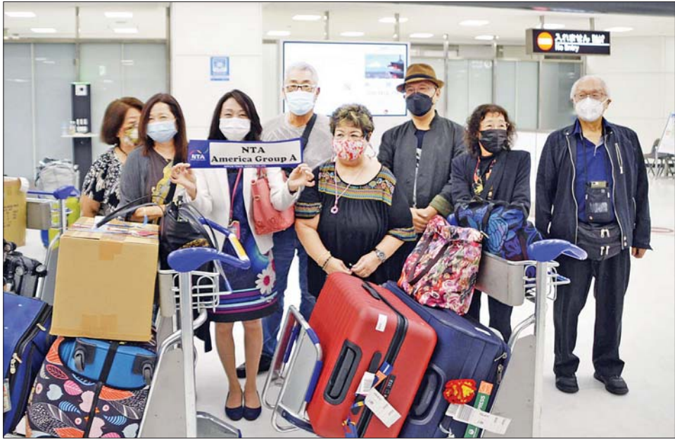
များကို ဖြစ်ပေါ်လာနိုင်သည့် ကိုဗစ်-၁၉ ကူးစက် ဖြစ်ပွားမှုများကို အကောင်းဆုံးထိန်းချုပ်နိုင်မည် ဖြစ်ကြောင်း အရာရှိများက ပြောသည်။

တိုကျို၊ မေ ၂၆ ကိုဗစ်-၁၉ စတင်ကူးစက်ဖြစ်ပွားချိန်မှစကာ နှစ်နှစ်အတွင်း ပထမဆုံးအကြိမ်အဖြစ် ဂျပန်နိုင်ငံ၏ နယ်စပ်များကို နိုင်ငံခြားသားခရီးသွားများအတွက် ဖွင့်လှစ်ပေးတော့မည်ဖြစ်သည်။ သို့သော်လည်း ကန့်သတ်ဖြေလျှော့မှုများကို တဖြည်းဖြည်းချင်း ပြုလုပ်သွားမည်ဖြစ်ကြောင်း ဂျပန်ဝန်ကြီးချုပ်က ပြောကြားလိုက်သည်။