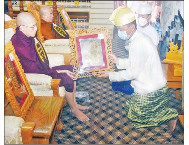
ရန်ကုန်တိုင်းစစ်ဌာနချုပ် တိုင်းမှူး ဗိုလ်ချုပ် ညွှန်ဝင်းဆွေ ဆရာတော်ထံ ဘွဲ့တံဆိပ်တော်နှင့် အောင်လက်မှတ် ဆက်ကပ်လှူဒါန်းစဉ်။