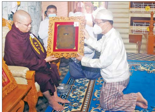
ပြည်ထောင်စုဝန်ကြီး ဦးကိုကို ဆရာတော်ထံ ဘွဲ့တံဆိပ်တော်နှင့် အောင်လက်မှတ် ဆက်ကပ်လှူဒါန်းစဉ်။