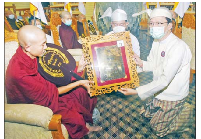
ပြည်ထောင်စုဝန်ကြီး ဒေါက်တာ သက်ခိုင်ဝင်း ဆရာတော်ထံ ဘွဲ့တံဆိပ်တော်နှင့် အောင်လက်မှတ် ဆက်ကပ်လှူဒါန်းစဉ်။