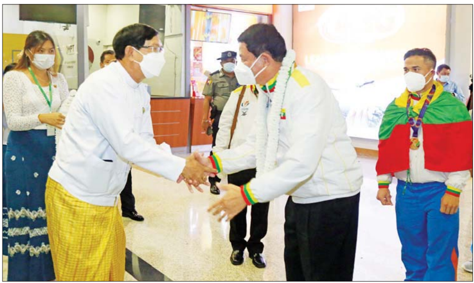
ပြည်ထောင်စုဝန်ကြီး ဦးမင်းသိန်းဇံအား ရန်ကုန်တိုင်းဒေသကြီး ဝန်ကြီးချုပ် ဦးစိုးသိန်းက ရန်ကုန် အပြည်ပြည်ဆိုင်ရာလေဆိပ်၌ ကြိုဆိုနှုတ်ဆက်စဉ်။

ဥက္ကဋ္ဌ၊ အားကစားနှင့်လူငယ်ရေးရာ ဝန်ကြီးဌာန ပြည်ထောင်စုဝန်ကြီး ဦးမင်းသိန်းဇံနှင့်အတူ ရွှေတံဆိပ်ဆု ရရှိခဲ့ကြသည့် ကာယဗလနှင့် ကာယကြံ့ခိုင်မှု အားကစားနည်းမှ ရဲထွန်းနောင် (+၇၀) ကီလို၊ ဝူရှူး အားကစားနည်းမှ သိန်းသန်းဦး (နန်းကွန်) တုတ်ရှည်၊ ပီတန်း အားကစားနည်းမှ ခင်ချယ်ရီသက် (Women Shooting)၊ ပြိုင်ပွဲ အသီးသီးမှ ငွေတံဆိပ်ဆုရရှိသူများ၊ ကြေးတံဆိပ်ဆုရရှိသူများနှင့်အတူ စစ်တုရင်၊ E-Sports၊ အမျိုးသမီး ဘောလုံး၊ အမျိုးသား ဘော်လီဘော အားကစားနည်းတို့မှ ပြိုင်ပွဲဝင် အားကစားသမားများနှင့် အပြည် ပြည်ဆိုင်ရာခိုင်လူကြီးများ ပြန်လည် လိုက်ပါလာကြသည်။