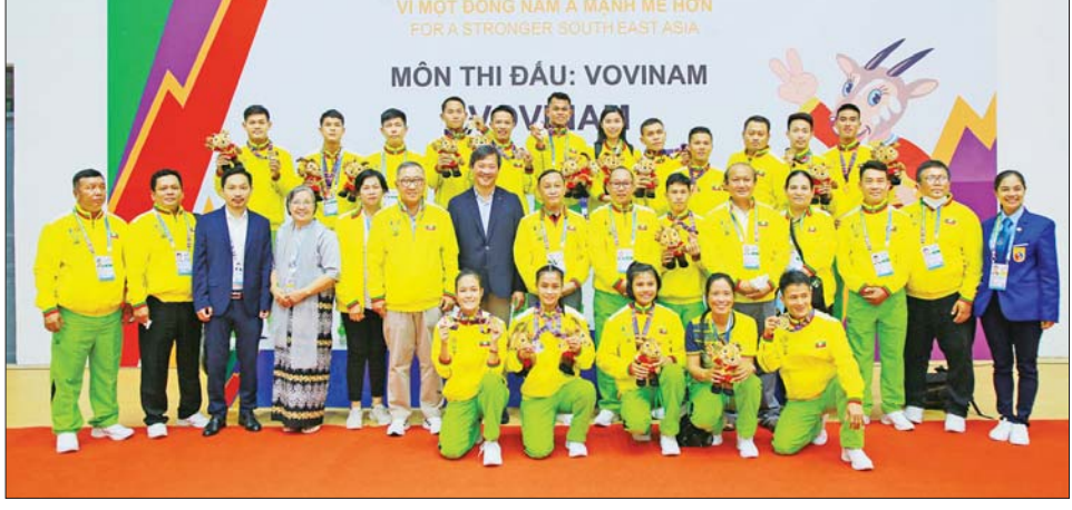
ဗိုဗီနမ်အားကစားနည်း၌ ရွှေတံဆိပ်ဆုရ ကစားသမားများနှင့် မြန်မာအားကစားအဖွဲ့။

တွင် ဘာရိန်း လက်ရွေးစင်အသင်း နှင့် ဖီဖာ (A) အဆင့် နိုင်ငံတကာ ခြေစမ်းပွဲတို့ ယှဉ်ပြိုင်ကစားမည် ဖြစ်သည်။ မြန်မာ့လက်ရွေးစင် အသင်းသည် အာရှဖလားတတိယ အဆင့်ခြေစစ်ပွဲတွင် အိမ်ရှင် ကာဂျစ္စတန်၊ တာဂျီကစ္စတန်၊ စင်ကာပူအသင်းများနှင့် အုပ်စု(F) ၌ ကျရောက်နေသည်။ မြန်မာ အသင်းသည် ထိုင်းနိုင်ငံ ဘန်ကောက်မြို့ရှိ Alpine Training Camp တွင် လေ့ကျင့်မှုများ ပြုလုပ်ကာ ခြေစမ်းပွဲများ ကစား ပြီးနောက် ဇွန် ၃ ရက်တွင် အာရှခြေစစ်ပွဲ ပွဲစဉ်များ ယှဉ်ပြိုင် ကစားရန် ကာဂျစ္စတန်နိုင်ငံသို့ ဆက်လက် ထွက်ခွာမည်ဖြစ် သည်။ အာရှဖလား တတိယ အဆင့် ခြေစစ်ပွဲကို ဇွန် ၈ ရက်မှ ၁၄ ရက်အထိ ကျင်းပမည်ဖြစ် သည်။ ရဲရင့်လွင်