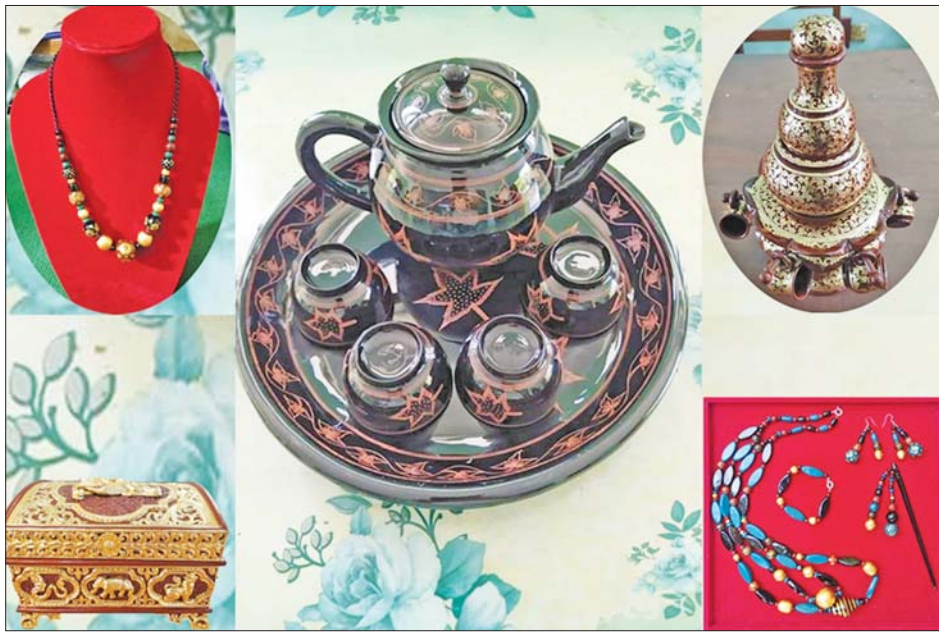
ယွန်းလက်မှုအရောင်းဆိုင်ရှိ ယွန်းထည်အသုံးအဆောင်ပစ္စည်းများ။

ယွန်းပညာရပ်ဆိုင်ရာ အသက်မွေးဝမ်းကျောင်း ကာလတိုသင်တန်းများအနေဖြင့် ဂျပန်ယွန်းထည်