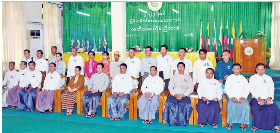
ပြည်ထောင်စုဝန်ကြီး ဦးမောင်မောင်အုန်းနှင့် တာဝန်ရှိသူများ ညီလာခံသို့တက်ရောက်လာကြသည့် စာပေပညာရှင်ကြီးများနှင့် အမှတ်တရ ဓာတ်ပုံရိုက်စဉ်။

အသင်းသူ အသင်းသားများကို ဂုဏ်ပြု အသင်း၏ ရည်ရွယ်ချက်လေးရပ်ကိုကြည့်လျှင် မွန်မြတ်လှသည့် ဦးတည်ချက်များဖြစ်သည့် အလျောက် ထိရောက်ပေါက်မြောက် အောင်မြင် အောင် မြန်မာနိုင်ငံ စာရေးဆရာအသင်းကြီးက စွမ်းဆောင်နိုင်ရည်ရှိသည်မှာ သိသာနေပါကြောင်း။ တတိယအကြိမ် ညီလာခံတွင် တင်သွင်းထားသည့် ဗဟိုအမှုဆောင်ကော်မတီ၏ အစီရင်ခံစာ ဖော်ပြ ချက်အရ မြို့နယ်ပေါင်း ၂၀၂ မြို့နယ်တွင် အသင်းဝင် ပေါင်း ၅၁၅၅ ဦးကျော်ရှိနေကြောင်း သိရသည့်အတွက် အားတက်ဂုဏ်ယူစရာကောင်းလှပါကြောင်း။ ထို့ အပြင် အသင်းသူ အသင်းသားများ၏ သာရေး၊ နာရေး ကိစ္စရပ်များ၊ စာပေဆိုင်ရာ ရပိုင်ခွင့်များ၊ မူပိုင် ခွင့်များ၊ စာတမ်းဖတ်ပွဲများ၊ မျိုးဆက်သစ်များအတွက် စာရေးနည်း အခြေခံသင်တန်းများ၊ နိုင်ငံတကာ စာပေနှင့် မြန်မာစာပေ အပြန်အလှန်ဖလှယ်ခြင်း၊ ဆွေးနွေးခြင်း၊ နိုင်ငံတကာ ကဗျာရွတ်ဆိုပွဲများတွင် တက်ရောက်ရွတ်ဆိုကြခြင်း၊ မဲခေါင်စာပေဆုရကြ ခြင်း၊ (၁၀)ကြိမ်မြောက် မဲခေါင်စာပေဆုချီးမြှင့်ပွဲကို အိမ်ရှင်နိုင်ငံအဖြစ် အောင်မြင်စွာထည့်စွာ လက်ခံ ကျင်းပနိုင်ခြင်း၊ နိုင်ငံတော်အဆင့်နှင့် ဌာနဆိုင်ရာ၊