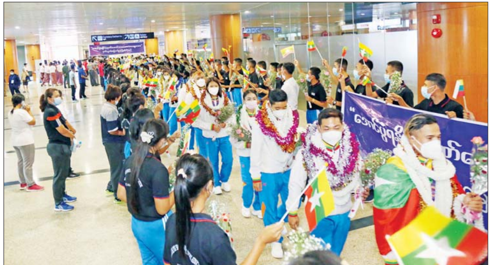
(၃၁) ကြိမ်မြောက် အရှေ့တောင်အာရှအားကစားပြိုင်ပွဲ၌ နိုင်ငံ့ဂုဏ်ဆောင်ခဲ့ကြသည့် အားကစားသမားများအား ရန်ကုန်အပြည်ပြည်ဆိုင်ရာလေဆိပ်၌ သောင်းသောင်းဖြဖြ ဂုဏ်ပြုကြိုဆိုကြစဉ်။

(၃၁) ကြိမ်မြောက် အရှေ့တောင် အာရှ အားကစားပြိုင်ပွဲတွင် မြန်မာနိုင်ငံမှ အားကစားနည်း ၂၀ ဝင်ရောက်ယှဉ်ပြိုင်ခဲ့ပြီး မေ ၂၂ ရက်အထိ ဗီယက်နမ်အားကစား နည်းမှ ရွှေတံဆိပ် သုံးခု၊ ငွေတံဆိပ် သုံးခု၊ ကြေးတံဆိပ် ခြောက်ခု၊ ဝူရှူးအားကစားနည်းမှ ရွှေတံဆိပ် တစ်ခု၊ ငွေတံဆိပ် နှစ်ခု၊ ကြေးတံဆိပ် နှစ်ခု၊ ကာယဗလနှင့် ကာယကြံ့ခိုင်မှု အားကစားနည်းမှ ရွှေတံဆိပ် တစ်ခု၊ ငွေတံဆိပ် နှစ်ခု၊ ကြေးတံဆိပ် တစ်ခု၊ Kurash အားကစားနည်းမှ ရွှေတံဆိပ် တစ်ခု၊ ငွေတံဆိပ် တစ်ခု၊