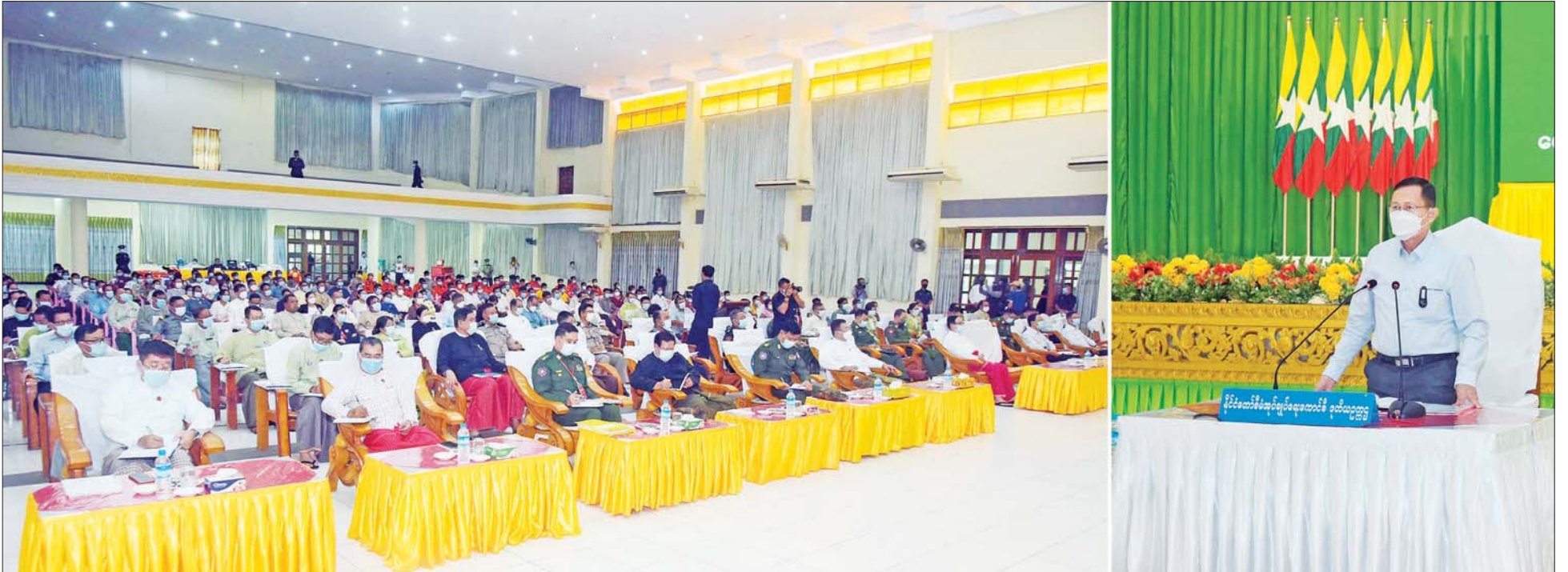
နိုင်ငံတော်စီမံအုပ်ချုပ်ရေးကောင်စီ ဒုတိယဥက္ကဋ္ဌ၊ အမျိုးသားသဘာဝဘေးအန္တရာယ်ဆိုင်ရာစီမံခန့်ခွဲမှုကော်မတီ ဥက္ကဋ္ဌ၊ ဒုတိယတပ်မတော်ကာကွယ်ရေးဦးစီးချုပ် ကာကွယ်ရေးဦးစီးချုပ်(ကြည်း) ဒုတိယဗိုလ်ချုပ်မှူးကြီး စိုးဝင်း ရေးဘေးသင့်ပြည်သူများ၊ မွန်ပြည်နယ်သဘာဝဘေးအန္တရာယ်ဆိုင်ရာ စီမံခန့်ခွဲမှုအဖွဲ့များနှင့် ဌာနဆိုင်ရာတာဝန်ရှိသူများအား တွေ့ဆုံပွဲတွင် အမှာစကားပြောကြားစဉ်။