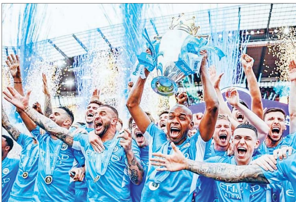
မန်စီးတီးကစားသမားများ ပရီမီယာလိဂ်ဖလားဆွတ်ခူးအပြီး အောင်ပွဲခံနေကြစဉ်။

၂၀၂၁-၂၀၂၂ ပရီမီယာလိဂ် ရာသီပတ်ပွဲစဉ်များကို မေ ၂၂ ရက် ညပိုင်း ၉ နာရီခွဲတွင် ပွဲစဉ်အားလုံး တစ်ချိန်တည်း ယှဉ်ပြိုင်ကစားခဲ့ရာ အမှတ်ပေးဖလား ဆွတ်ခူးရန် အရေးပါသည့် ဦးဆောင်သူ မန်စီးတီးအသင်းနှင့် အက်စ်တွန် ဗီလာအသင်းတို့ ပွဲစဉ်၌ မန်စီးတီး အသင်းသည် နှစ်ဂိုးပြတ်ရှုံးနိမ့်ခဲ့ ရာမှ ချေပဂိုးနှင့် အနိုင်ဂိုးများ သွင်းယူနိုင်ခဲ့သောကြောင့် သုံးဂိုး- နှစ်ဂိုးဖြင့် မန်စီးတီးအသင်း အနိုင် ရရှိပြီး အမှတ်ပေးဖလားကို မြောက် ကြိမ်မြောက် ဆွတ်ခူးနိုင်ခဲ့သည်။ ဦးဆောင်သူ မန်စီးတီးအသင်း ကို ထက်ကြပ်မကွာ ဖိအားပေး လျက်ရှိသော လီဗာပူးအသင်း သည် ရာသီပတ်ပွဲစဉ်တွင် ဝုဖ်အသင်းကို အနိုင်ရရှိခဲ့သော်