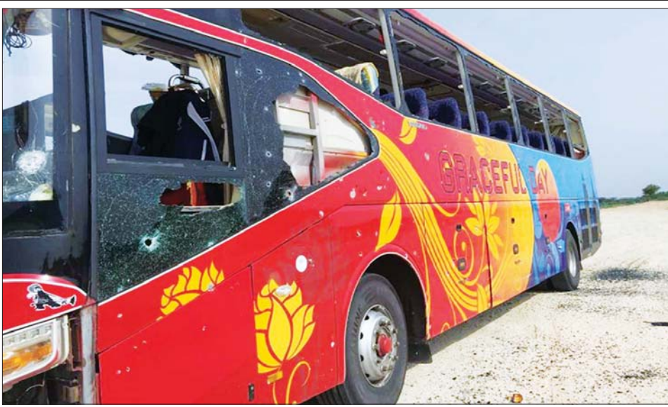
အကြမ်းဖက်သမားများ မိုင်းခွဲတိုက်ခိုက်မှုကြောင့် ပျက်စီးသွားသည့် ခရီးသည်ယာဉ်။

❖ ကျောဖုံးမှ ဖြစ်စဉ်တွင် ထိခိုက်ဒဏ်ရာ ရရှိခဲ့သူများကို ဆေးကုသမှုခံယူ နိုင်ရေး လုံခြုံရေးတပ်ဖွဲ့ဝင်များ က မန္တလေးမြို့ပြည်သူ့ဆေးရုံကြီး သို့ ပို့ဆောင်ပေးခဲ့ပြီး ခရီးသွား ပြည်သူများ ထိခိုက်ဒဏ်ရာရရှိ စေရန် လက်လုပ်မိုင်းဖြင့် ဖောက်ခွဲ တိုက်ခိုက်ခဲ့သည့် အကြမ်းဖက် သမားများကို ဖော်ထုတ်ဖမ်းဆီး ရမိနိုင်ရေး လုံခြုံရေးတပ်ဖွဲ့ဝင် များက ဆက်လက်ဆောင်ရွက် လျက်ရှိကြောင်း သတင်းရရှိ သည်။ သတင်းစဉ်