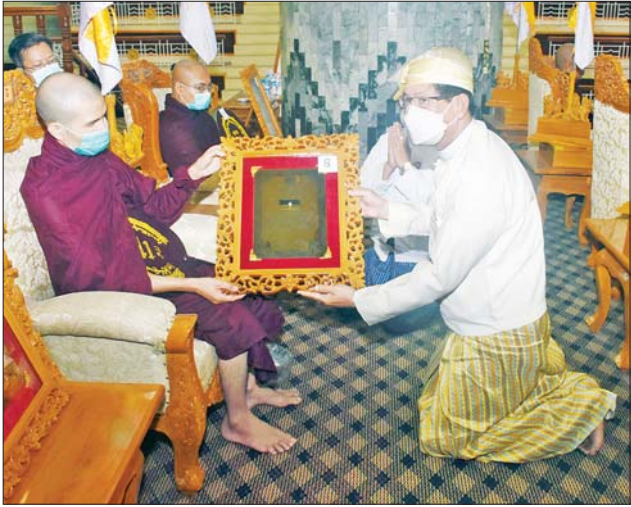
ရန်ကုန်တိုင်းဒေသကြီးအစိုးရအဖွဲ့ ဝန်ကြီးချုပ် ဦးစိုးသိန်း ဆရာတော်ထံ ဘွဲ့တံဆိပ်တော်နှင့် အောင်လက်မှတ် ဆက်ကပ်လှူဒါန်းစဉ်။