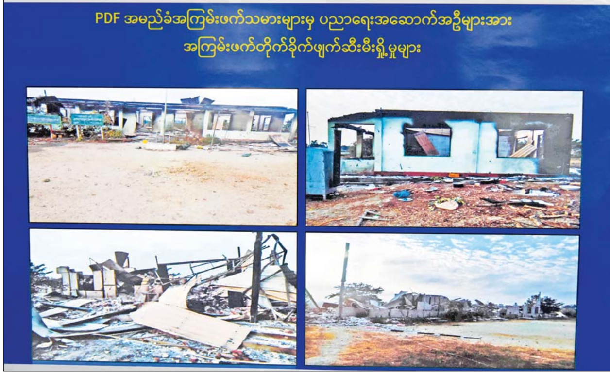
PDF အမည်ခံအကြမ်းဖက်သမားများမှ ပညာရေးအဆောက်အအုံများအား အကြမ်းဖက်တိုက်ခိုက်ဖျက်ဆီးမီးရှို့မှုများ