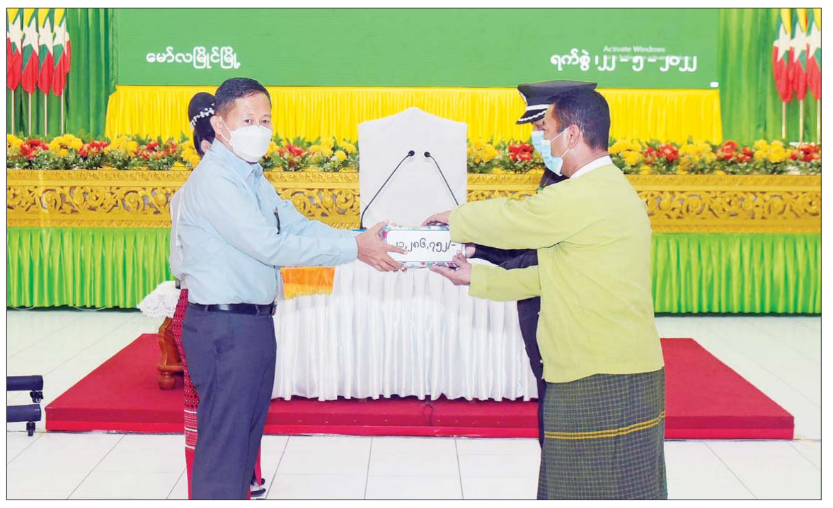
နိုင်ငံတော်စီမံအုပ်ချုပ်ရေးကောင်စီ ဒုတိယဥက္ကဋ္ဌ၊ အမျိုးသားသဘာဝဘေးအန္တရာယ်ဆိုင်ရာစီမံခန့်ခွဲမှုကော်မတီ ဥက္ကဋ္ဌ၊ ဒုတိယတပ်မတော်ကာကွယ်ရေးဦးစီးချုပ် ကာကွယ်ရေးဦးစီးချုပ်(ကြည်း) ဒုတိယဗိုလ်ချုပ်မှူးကြီး စိုးဝင်း သဘာဝဘေးသင့်ပြည်သူများအတွက် ဆန်၊ အိမ်ဆောက်ပစ္စည်းများ၊ ထောက်ပံ့ငွေများ၊ ကူညီကယ်ဆယ်ရေးပစ္စည်းများကို ပေးအပ်ရာ တာဝန်ရှိသူများက လက်ခံရယူစဉ်။

ဆောင်ရွက်ပေးနေမှု အခြေအနေ၊ ရေကြီးရေလျှံမှုများကြောင့် လမ်း၊ တံတား၊ အဆောက်အဦများ ပျက်စီးဆုံးရှုံးခဲ့မှုနှင့် ပြုပြင်ပြီးစီးမှုအခြေအနေ၊ သဘာဝဘေးအန္တရာယ်ဆိုင်ရာ စီမံခန့်ခွဲမှုအဖွဲ့များ ဖွဲ့စည်းထားရှိမှု၊ ရေဘေးရှောင်ပြည်သူများအား လိုအပ်သော ကျန်းမာရေးစောင့်ရှောက်မှုလုပ်ငန်းများ ဆောင်ရွက်ပေးမှု အခြေအနေများကို ရှင်းလင်းတင်ပြသည်။ အခက်အခဲများကိုဖြေရှင်းပေး ထို့နောက် နိုင်ငံတော်စီမံအုပ်ချုပ်ရေးကောင်စီ ဒုတိယဥက္ကဋ္ဌ၊ အမျိုးသားသဘာဝဘေးအန္တရာယ်ဆိုင်ရာ စီမံခန့်ခွဲမှုကော်မတီဥက္ကဋ္ဌ၊ ဒုတိယတပ်မတော်ကာကွယ်ရေးဦးစီးချုပ် ကာကွယ်ရေးဦးစီးချုပ်(ကြည်း)က အမှာစကားပြောကြားရာတွင် မေ ၂၀ ရက်တွင် ဖြစ်ပွားခဲ့သည့် မုန်တိုင်းငယ်ကြီးတွေ့မှုတွင် ပြည်နယ်အစိုးရ၏ မှန်ကန်သောစုစည်းမှု၊ ကောင်းမွန်သည့် ဇာတ်တိုက်လေ့ကျင့်မှု၊ ပြည်သူများ၏ ပူးပေါင်းပါဝင်မှုဖြင့် ၂၄ နာရီအတွင်း ဖြစ်ပေါ်ခဲ့သည့် ပြဿနာအခက်အခဲများကို ဖြေရှင်းပေးနိုင်ခဲ့ကြောင်း၊ နိုင်ငံတော်ဝန်ကြီးချုပ်၏ လမ်းညွှန်မှုဖြင့် သဘာဝဘေးအန္တရာယ်အပေါ်ပြည်နယ်အစိုးရ၏ ဖြေရှင်းဆောင်ရွက်မှုကို မျက်မြင်ကြည့်ရှု၍ လိုအပ်သည်များ ဖြေရှင်းဆောင်ရွက်ပေးနိုင်ရန်နှင့် ဘေးအန္တရာယ်ကျရောက်ခဲ့သည့် ဒေသခံပြည်သူများအား အားပေးစောင့်ရှောက်ရန် လာရောက်ခြင်းဖြစ်ကြောင်း၊ အမျိုးသားသဘာဝဘေးအန္တရာယ်ဆိုင်ရာစီမံခန့်ခွဲမှုကော်မတီအနေဖြင့် တိုင်းဒေသကြီးနှင့် ပြည်နယ်အဆင့် သဘာဝဘေးအန္တရာယ်ဆိုင်ရာ စီမံခန့်ခွဲမှုကော်မတီများနှင့် Video conferencing ဖြင့် တွေ့ဆုံ၍