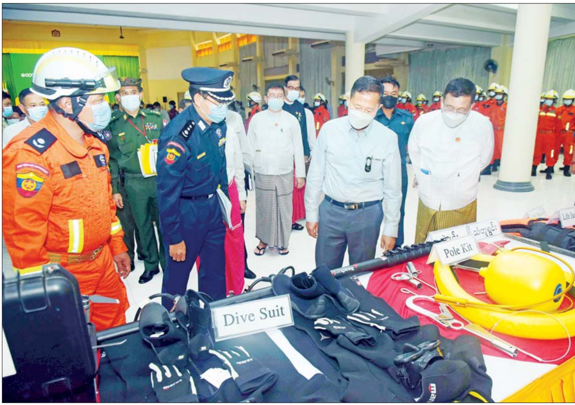
နိုင်ငံတော်စီမံအုပ်ချုပ်ရေးကောင်စီ ဒုတိယဥက္ကဋ္ဌ၊ အမျိုးသားသဘာဝဘေးအန္တရာယ်ဆိုင်ရာစီမံခန့်ခွဲမှုကော်မတီ ဥက္ကဋ္ဌ၊ ဒုတိယတပ်မတော်ကာကွယ်ရေးဦးစီးချုပ် ကာကွယ်ရေးဦးစီးချုပ်(ကြည်း) ဒုတိယဗိုလ်ချုပ်မှူးကြီး စိုးဝင်း အသင့်ပြင်ဆင်စုဖွဲ့ထားရှိသော ကူညီကယ်ဆယ်ရေးပစ္စည်းများနှင့် ယာဉ်၊ ယန္တရားများကို လိုက်လံကြည့်ရှုစဉ်။

သဘာဝဘေးအန္တရာယ်နှင့် ပတ်သက်လျှင် ဖြေရှင်းဆောင်ရွက်နိုင်ရန်အတွက် အမျိုးသားသဘာဝဘေးအန္တရာယ်စီမံခန့်ခွဲမှုကော်မတီ၊ တိုင်းဒေသကြီးနှင့် ပြည်နယ်အဆင့် သဘာဝဘေးအန္တရာယ်စီမံခန့်ခွဲမှုကော်မတီများဖွဲ့စည်း၍ စီမံချက်များရေးဆွဲဆောင်ရွက်လျက်ရှိကြောင်း၊ စီမံချက်များရေးဆွဲရာတွင် နာဂစ်ဆိုင်ကလုန်း မုန်တိုင်း၊ ဂီရိမုန်တိုင်း၊ တာလေငလျင်၊ ကလေး-ကလေးဝမြို့ မြစ်သာမြစ်နှင့် နေရောင်ခြည်ကြော့ရေလျှံမှုစသည့် အတွေ့အကြုံများကို အခြေခံ၍ ရေးဆွဲထားပြီး ဒေသအလိုက် ဖြစ်ပေါ်တတ်သည့် မီးဘေး၊ ရေဘေး၊ လေဘေး စသည့် သဘာဝဘေးအန္တရာယ်အမျိုးမျိုးတို့ကို ထည့်သွင်းရေးဆွဲထားခြင်းဖြစ်ကြောင်း၊ သဘာဝဘေးအန္တရာယ်ဟူသည် တားဆီးရန်မဖြစ်နိုင်သဖြင့် မဖြစ်မိက ကြိုတင်ပြင်ဆင်စုဖွဲ့ထားခြင်း၊ ဇာတ်တိုက် လေ့ကျင့်ထားခြင်းနှင့် ဖြစ်ပေါ်လာပါက ပူးပေါင်းဆောင်ရွက်ခြင်းဖြင့် ကျော်လွှားနိုင်မည်ဖြစ်ကြောင်း၊ ဖြစ်ပွားပြီးပါကလည်း နောက်ဆက်တွဲ ဘေးထွက်ဆိုးကျိုးများအတွက် ကြိုတင်မျှော်တွေး၍ ပြင်ဆင်ထားရန်လိုကြောင်း၊ ဥပမာအနေဖြင့် မုန်တိုင်းနှင့်အတူ ထူးကဲဒီရေတက်ခြင်း ဖြစ်ပေါ်တတ်ပြီး ရေကျချိန်တွင် အညစ်အကြေးများကျန်ရှိခြင်း၊ မှက်၊ ခြင်၊ ယင်များမှတစ်ဆင့် ကူးစက်ရောဂါများ ဖြစ်ပေါ်တတ်ခြင်း၊ မသန့်ရှင်းသည့်