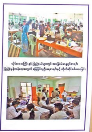
မဲဆန္ဒရှင် အသိပညာပေးခြင်းနှင့်ပတ်သက်၍ သတင်းစာရှင်းလင်းပွဲတွင် ပြသထားသည့် မှတ်တမ်းဓာတ်ပုံများ။

အစည်းတစ်ခု၊ အဖွဲ့အစည်းတစ်ခုခု၊ ပုဂ္ဂိုလ်တစ်ဦးဦး၏ ငွေကြေး၊ ပစ္စည်း၊ အထောက်အပံ့များကို တစ်နည်းနည်းဖြင့် ရယူသည့်အဖွဲ့အစည်းများ၊ လူပုဂ္ဂိုလ်များဖြစ်ကြောင်း၊ နောက်တစ်ခုမှာ ဘာသာရေးကို နိုင်ငံရေးအရ အလွဲသုံးစားပြုသည့် အဖွဲ့အစည်းများဖြစ်ကြောင်း၊ ထိုအဖွဲ့အစည်းများဆိုပါက ပုဒ်မ ၄၀၇ နှင့် ငြိစွန်းကြောင်း၊ ထိုကဲ့သို့ ငြိစွန်းပါက ပုဒ်မ ၄၀၈ အရ အဆိုပါပါတီကို နိုင်ငံရေးပါတီအဖြစ်မှ ပယ်ဖျက်ရမည်ဟု ပြဋ္ဌာန်းထားကြောင်း၊ ယင်းမှာ နိုင်ငံရေးပါတီအဖြစ် ဆက်လက်ရပ်တည်ပိုင်ခွင့်မရှိသည့် ပုဒ်မ ၄၀၇ ဖြစ်ကြောင်း။