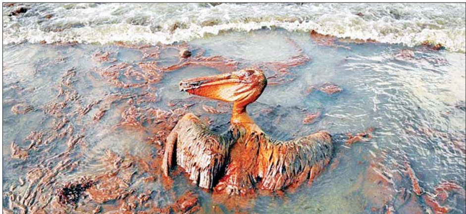
၂၀၁၀ ပြည့်နှစ်က မက္ကဆီကိုပင်လယ်ကွေ့ ရေနံယိုဖိတ်မှုဖြစ်ပွားပြီးနောက် ဆီများအတွင်း နစ်မြုပ်နေသဖြင့် အသက်ရှင်ရန် ရုန်းကန်နေသည့် ငှက်တစ်ကောင်ကို တွေ့ရစဉ်။

အဆိုပါ ဆန်းသစ်တီထွင်သော နည်းပညာသစ်သည် သဘာဝအလျောက်ဖြစ်ပေါ်နေသည့် ရွှံ့စေး သတ္တုဓာတ်နှင့် သံလိုက်ဓာတ်မြင့်မားသော သတ္တုဓာတ်ဖြစ်သည့် ဟာလွိုင်ဆိုက်မှပြုလုပ်သော သေးငယ်သည့် နာနိုပြွန်များဖြင့် စုပ်ယူဖယ်ရှားသည့် နည်းပညာဖြစ်သည်။