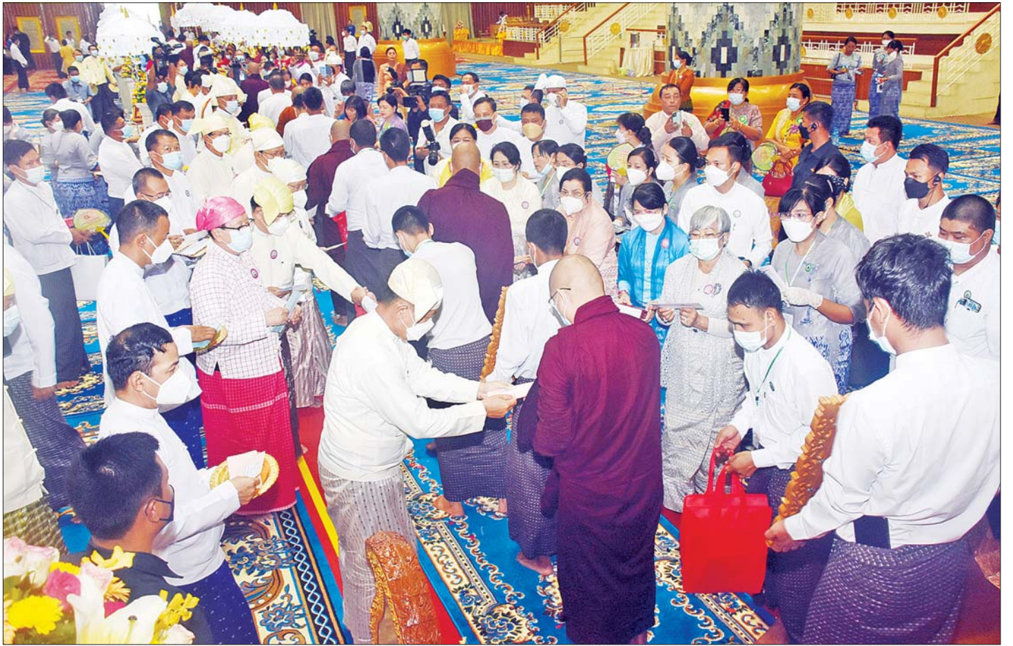
နိုင်ငံတော်စီမံအုပ်ချုပ်ရေးကောင်စီ ဒုတိယဥက္ကဋ္ဌ ဒုတိယတပ်မတော်ကာကွယ်ရေးဦးစီးချုပ် ကာကွယ်ရေးဦးစီးချုပ်(ကြည်း) ဒုတိယဗိုလ်ချုပ်မှူးကြီး စိုးဝင်းနှင့် ဇနီး၊ အဖွဲ့ဝင်များ စာအောင်သံဃာတော်များအား လှူဖွယ်ဝတ္ထုပစ္စည်းများ လှူဒါန်းကြစဉ်။

ထို့နောက် (၇၄) ကြိမ်မြောက် တိပိဋကဓရ တိပိဋကကောဝိဒ ရွေးချယ်ရေးစာမေးပွဲတွင် အောင်မြင်တော်မူကြသည့် သာသနာ့အာဇာနည် အရှင်မြတ်များအား ဘွဲ့တံဆိပ်တော်နှင့် အောင်လက်မှတ်များ ဆက်ကပ်ကြရာ ပိဋကတ်နှစ်ပုံခွဲ သဘောရေးဖြေအောင်မြင်တော်မူသည့် ရန်ကုန် တိုင်းဒေသကြီး ဒဂုံမြို့သစ်(အရှေ့ပိုင်း)မြို့နယ် တိပိဋကမဟာဂန္ထဝင် နိကာယ်ကျောင်းတိုက်မှ အရှင်မာနိတအား မူလအတိပိဋကကောဝိဒ ဘွဲ့တံဆိပ် တော်နှင့် အောင်လက်မှတ်ကို နိုင်ငံတော်စီမံအုပ်ချုပ် ရေးကောင်စီ ဒုတိယဥက္ကဋ္ဌ ဒုတိယတပ်မတော် ကာကွယ်ရေးဦးစီးချုပ် ကာကွယ်ရေးဦးစီးချုပ် (ကြည်း) ဒုတိယဗိုလ်ချုပ်မှူးကြီး စိုးဝင်းက လည်း ကောင်း၊ ပိဋကတ်နှစ်ပုံ သဘောရေးဖြေအောင် ဒီဃနိကာယကောဝိဒ ဘွဲ့တံဆိပ်တော်ရ ရန်ကုန် တိုင်းဒေသကြီး ဒဂုံမြို့သစ်(အရှေ့ပိုင်း)မြို့နယ် တိပိဋက မဟာဂန္ထဝင် နိကာယ်ကျောင်းတိုက်မှ အရှင် အာစာရာလင်္ကာရအား နိုင်ငံတော်စီမံအုပ်ချုပ် ရေးကောင်စီအဖွဲ့ဝင် ဒေါက်တာ ဗညားအောင်မိုး က ဘွဲ့တံဆိပ်တော်နှင့် အောင်လက်မှတ်ကို လည်းကောင်း ဆက်ကပ်လှူဒါန်းသည်။