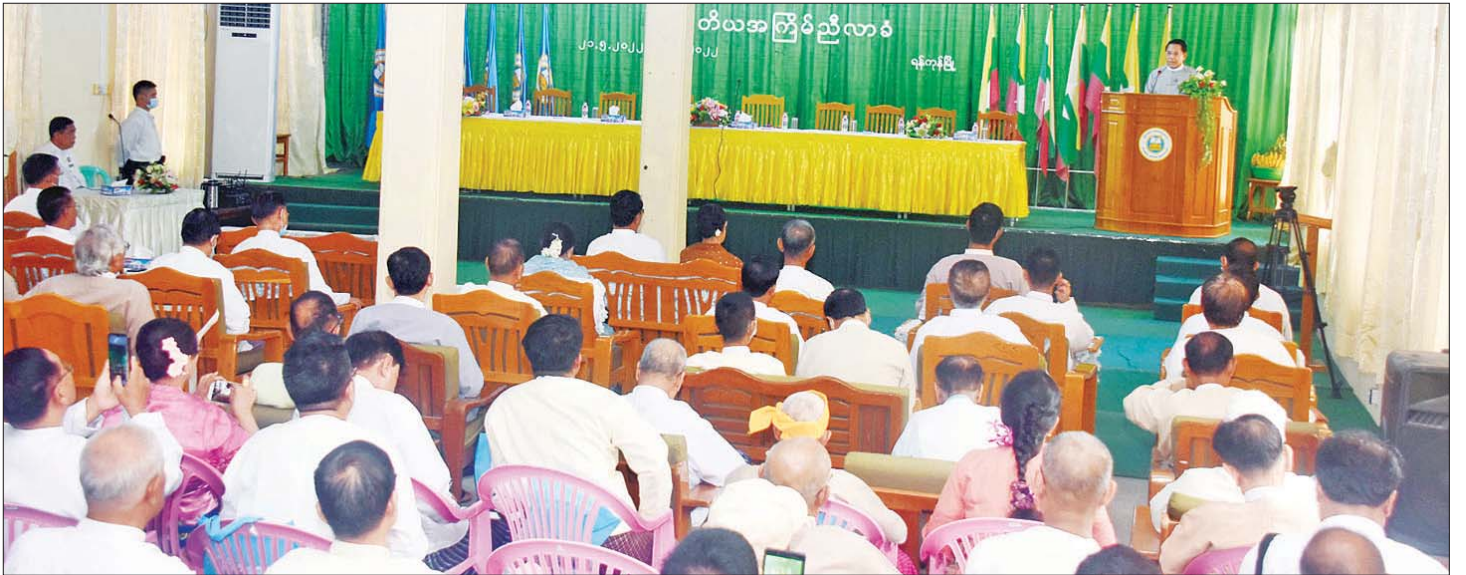
ပြည်ထောင်စုဝန်ကြီး ဦးမောင်မောင်အုန်း မြန်မာနိုင်ငံစာရေးဆရာအသင်း တတိယအကြိမ်ညီလာခံတွင် အမှာစကားပြောကြားစဉ်။

မြန်မာနိုင်ငံ စာရေးဆရာအသင်းသည် နိုင်ငံ အကျိုးပြု သုတ၊ ရသစာပေများ ဖွံ့ဖြိုးတိုးတက်အောင် ဆောင်ရွက်ရန်၊ စာပေလောကသား အချင်းချင်း၏ စည်းလုံးညီညွတ်မှုခိုင်မာရေးကို တိုးမြှင့်ဆောင်ရွက် ရန်၊ စာပေလောကသားအားလုံး၏ သာရေး နာရေး ကိစ္စများကို ကူညီဆောင်ရွက်ရန်၊ ဂန္ထဝင်စာပေနှင့် ခေတ်ပြိုင်စာပေများကို စာဖတ်ပရိသတ်လက်ဝယ်သို့ ရောက်ရှိရေးအတွက် ကူညီဆောင်ရွက်ရန်ဆိုသည့် ရည်ရွယ်ချက်လေးရပ်ဖြင့် ရပ်တည်လှုပ်ရှားခဲ့ရာ တတိယအကြိမ် ညီလာခံကျင်းပနိုင်သည့် အခြေ အနေအထိ ရောက်ရှိလာခဲ့ပြီဖြစ်ပါကြောင်း။