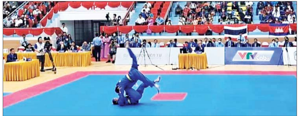
ဗိုလီနစ်ပြိုင်ပွဲတွင် ရွှေတံဆိပ်ဆုရ မြန်မာအားကစားသမားနှစ်ဦး သရုပ်ပြယှဉ်ပြိုင်စဉ်။

ပြည်ထောင်စုဝန်ကြီးနှင့် အဖွဲ့ သည့် ယနေ့ယှဉ်ပြိုင်လျက်ရှိသော အားကစားနည်းများမှ ပိုက်ကျော် ခြင်း အားကစားပြိုင်ပွဲ၊ ဘော်လီ ဘော အားကစားပြိုင်ပွဲနှင့် ဘောလုံး(အမျိုးသမီး) အားကစား ပြိုင်ပွဲများတွင် မြန်မာအသင်း ဝင်ရောက်ယှဉ်ပြိုင် ကစားနေမှု များကို သွားရောက်ကြည့်ရှု အားပေးခဲ့သည်။ ယနေ့ပြိုင်ပွဲ ပွဲစဉ်များအဖြစ် စစ်တုရင်၊ ပီတန်း၊ ပိုက်ကျော်ခြင်း၊ သေနတ်ပစ်၊ ကနူး၊ E-sports၊ ပြေးခုန်ပစ်၊ ဘီလီယက်၊ ဖူဆယ်၊ တိုက်ကွမ်ဒို၊ ဘော်လီဘော၊ ဗိုလီနစ်၊ လက်ဝှေ့နှင့် ဘောလုံး (အမျိုးသမီး) အားကစားနည်းများ တွင် ဝင်ရောက်ယှဉ်ပြိုင်ခဲ့ကြပြီး ၁၉-၅-၂၀၂၂ ရက် ပြိုင်ပွဲ ပွဲစဉ် များအဖြစ် ပြေးခုန်ပစ်၊ စစ်တုရင်၊ သေနတ်ပစ်၊ ပိုက်ကျော်ခြင်း၊ ကနူးလှေလှော်၊ E-sports၊ ဖူဆယ်၊ ဘီလီယက်၊ လက်ဝှေ့၊ ဂျူဒို၊ တိုက်ကွမ်ဒို၊ အလေးမနှင့် ဗိုလီနစ် အားကစားပြိုင်ပွဲများကို ဆက်လက် ဝင်ရောက်ယှဉ်ပြိုင် ကစားသွားမည်ဖြစ်သည်။