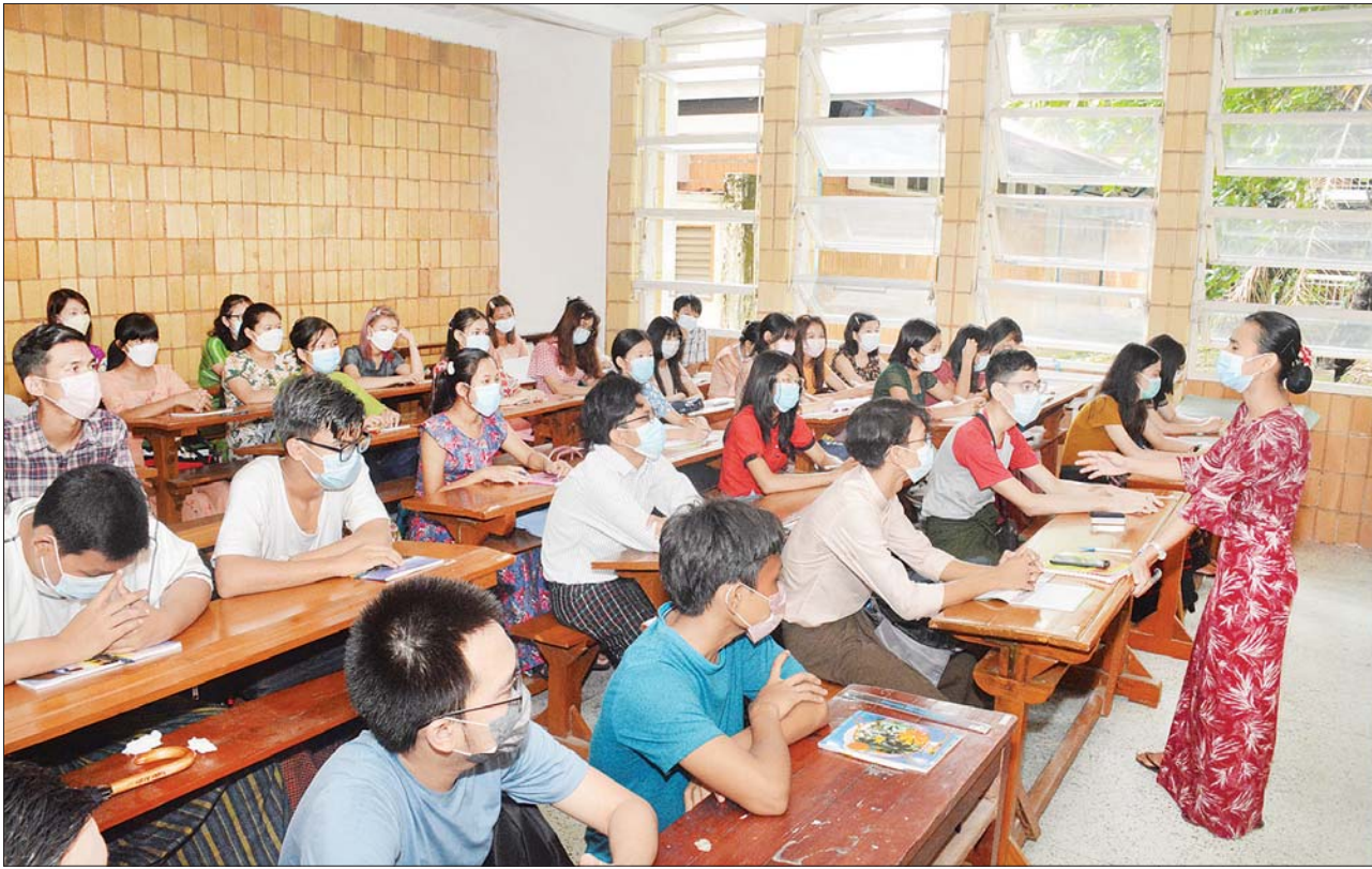
ကျောင်းသား ကျောင်းသူများ အေးချမ်းစွာ ပညာသင်ကြားနေမှုကို တွေ့ရစဉ်။

၁၃၈၄ ခုနှစ်၊ ကဆုန်လပြည့်ကျော် ၅ ရက် ၂၀၂၂ ခုနှစ်၊ မေ ၁၉ ရက်၊ ကြာသပတေးနေ့ အတွဲ (၆၁)၊ အမှတ် (၂၂၆)