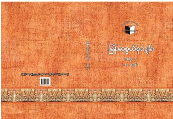
ပြန်ကြားရေးဝန်ကြီးဌာန ပုံနှိပ်ရေးနှင့် ထုတ်ဝေရေးဦးစီးဌာန၏ “စာပေဗိမာန်” နှင့် “ထွန်းဖောင်ဒေးရှင်း” တို့ ပူးပေါင်း၍ မကြာမီ ထုတ်ဝေတော့မည့် “မြန်မာ့စွယ်စုံကျမ်း” အတွဲ (၁) (က-ကုတ်) စာအုပ်

မြန်မာ့စွယ်စုံကျမ်းနှင့်ပတ်သက်၍ မြန်မာနိုင်ငံဘာသာပြန်စာပေ အသင်းဥက္ကဋ္ဌ နိုင်ငံတော်ဝန်ကြီးချုပ်ဦးနုက “လွတ်လပ်ရေးရ၍ ကျွန်တော်တို့၏ လက်တွင်းသို့ အချုပ်အခြာအာဏာ ရောက်လာသည် နှင့် တစ်ပြိုင်နက်၊ ကျွန်တော်တို့၏ ပထမဦးဆုံးလုပ်ငန်းသည် အမှောင် ခွင်း၍ အလင်းဆောင်ရမည့် လုပ်ငန်းပင်ဖြစ်သည်။ ထိုအမှောင် တည်းဟူသော ကျွန်တော်တို့၏ ရန်သူနံပါတ် (၁) ကို ဖြိုခွင်းချေမှုန်းရန်၊ ကျွန်တော်တို့၏ တပ်မဟာများသည် အခြားမဟုတ်၊ ဘဝသစ်ပညာရေး တပ်မဟာ၊ လူထုပညာရေး တပ်မဟာ၊ စာပေဗိမာန် တပ်မဟာများဖြစ် ၍ ဤစွယ်စုံကျမ်းကြီးသည်ကား ကျွန်တော်တို့ အသုံးပြုမည့် လက်နက်ကောင်းကြီးတစ်ခု ဖြစ်သည်။ ဤလက်နက်ကောင်းကြီး၏ အစွမ်းသတ္တိကား အဘယ်နည်း။