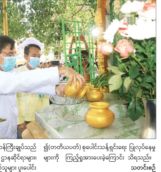
ယင်းနောက် တိုင်းဒေသကြီး ဝန်ကြီးချုပ်သည် ရွှေ(တတ်ယပတ်) စုပေါင်းသန့်ရှင်းရေး ပြုလုပ်နေမှု မြို့ရွာသန့်ရှင်းသာယာလှပစေရေး ဌာနဆိုင်ရာများ၊ များကို ကြည့်ရှုအားပေးခဲ့ကြောင်း သိရသည်။ တပ်ရင်းတပ်ဖွဲ့များနှင့် ဒေသခံပြည်သူများ ပူးပေါင်း သတင်းစဉ်

စေတီတော်ဖြစ်သည့် ရွှေညောင်ပင်နှင့် ဗုဒ္ဓရုပ်ပွားတော်တို့အား မြတ်ဗုဒ္ဓအား ရည်စူး၍ညောင်ရေများ သွန်းလောင်းပူဇော်ကြသည်။ ကဆုန်လပြည့် (ဗုဒ္ဓနေ့)၌ ပဲခူးမြို့ရှိ မဟာစေတီတော်မြတ်ကြီး၊ ရွှေသာလျောင်း ရုပ်ပွားတော်မြတ်ကြီး၊ ဗုဒ္ဓဂယာစေတီတော်မြတ်ကြီး၊ ကျိုက်ပွန်လေးမျက်နှာစေတီတော်မြတ်ကြီး၊ ဟင်္သာကုန်းစေတီတော်မြတ်ကြီးစသည့် ဘုရား၊ ယုဝိုး၊ စေတီတော်များတွင် ရဟန်း၊ ရင်၊ လူ၊ ပြည်သူများက ကဆုန်ညောင်ရေသွန်းလောင်းလှူပူဇော်ပွဲများ၊ စတုဒိသာများကျွေးမွေးလှူဒါန်းခြင်းများ စည်ကားသိုက်မြိုက်စွာ ကျင်းပပြုလုပ်လျက်ရှိသည့်အပြင် ရပ်ကွက်များအတွင်းရှိ ဘုန်းတော်ကြီးကျောင်းများနှင့် သာသနိကအဆောက်အအုံ မွေ့ရုံများရှိ ဗဟာဗောဓိညောင်ပင်များ၌ မြတ်ဗုဒ္ဓ၏ ပရိဘောဂစေတီတော်ဖြစ်သည့် ညောင်ပင်ကို ညောင်ရေများသွန်းလောင်းပူဇော်ကြသည်။