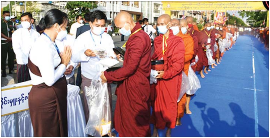
အလယ်ပိုင်းတိုင်းစစ်ဌာနချုပ် တိုင်းမှူး ဗိုလ်ချုပ်ကိုကိုဦး သံဃာတော်များအား လှူဖွယ်ပစ္စည်းများ ဆက်ကပ်လှူဒါန်းစဉ်။