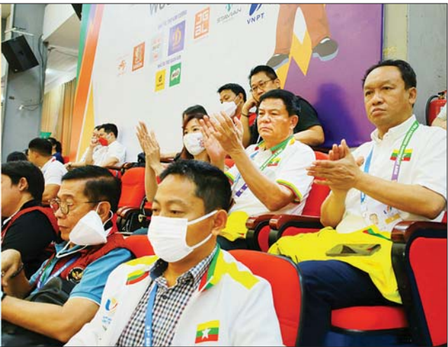
ပြည်ထောင်စုဝန်ကြီး ဦးမင်းသိန်းဇော်နှင့်အဖွဲ့၊ ဝှံ့တံဆိပ်၊ အမျိုးသမီး ယှဉ်ပြိုင်ပွဲတွင် မစန္ဒီဦး ယှဉ်ပြိုင်နေမှုကို ကြည့်ရှုအားပေးစဉ်။

နိုင်ငံ အိုလံပစ်ကော်မတီဥက္ကဋ္ဌ အားကစားနှင့် လူငယ်ရေးရာ ဝန်ကြီးဌာန ပြည်ထောင်စုဝန်ကြီး ဦးမင်းသိန်းဇော်၊ အားကစားနှင့် ကာယဗလဦးစီးဌာန ညွှန်ကြား