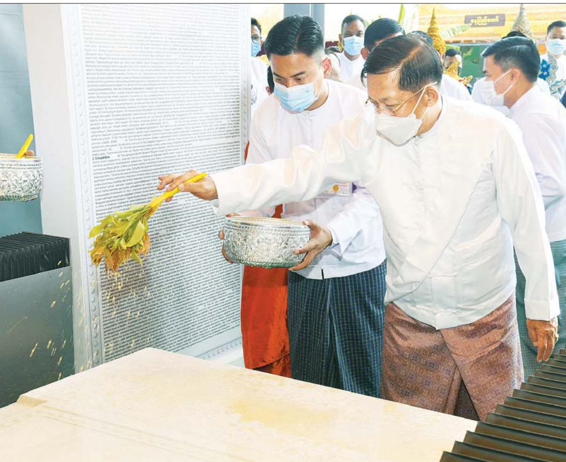
နိုင်ငံတော်စီမံအုပ်ချုပ်ရေး ကောင်စီဥက္ကဋ္ဌ နိုင်ငံတော်ဝန်ကြီးချုပ် ဗိုလ်ချုပ်မှူးကြီး မင်းအောင်လှိုင် ပိဋကတ်ကျောက်စာတော်များကို ပရိတ်နံ့သာရည်များ ပက်ဖျန်းစဉ်။

တက်ရောက်ကြ အခမ်းအနားသို့ နိုင်ငံတော်သံဃမဟာနာယကအဖွဲ့ ဥက္ကဋ္ဌ၊ မန္တလေးမြို့ ဗန်းမော်ကျောင်းတိုက်ဆရာတော် အဘိဓဇမဟာရဋ္ဌဂုရု၊ အဘိဓဇအဂ္ဂမဟာသဒ္ဓမ္မဇောတိက ဒေါက်တာ ဘဒ္ဒန္တကုမာရာဘိဝံသ၊ သီတဂူကမ္ဘာ့ဗုဒ္ဓတက္ကသိုလ်များ၏ အဓိပတိ ရွှေကျင်နိကာယ ဥပဋ္ဌက္ကဋ္ဌ အဘိဓဇမဟာရဋ္ဌဂုရု အဘိဓဇအဂ္ဂမဟာသဒ္ဓမ္မဇောတိက မဟာဓမ္မကထိက ဗဟုဇနဟိတဓရ ဒေါက်တာ ဘဒ္ဒန္တဉာဏိဿရ နေပြည်တော် လယ်ဝေးမြို့ ပေါက်မြိုင်ကျောင်းတိုက် ပဓာနနာယက အဘိဓဇမဟာရဋ္ဌဂုရု ဘဒ္ဒန္တဇနိန္ဒာ၊ တပ်ကုန်းမြို့ မဟာသီဟနာဒကျောင်းတိုက်ဆရာတော် အဘိဓဇ မဟာရဋ္ဌဂုရု ဘဒ္ဒန္တအာစိဏ္ဏတို့ အမှူးပြုသည့် သံဃာတော်များ ကြွရောက် ချီးမြှင့်တော်မူကြပြီး နိုင်ငံတော်စီမံအုပ်ချုပ်ရေး ကောင်စီဥက္ကဋ္ဌ နိုင်ငံတော်ဝန်ကြီးချုပ် ဗိုလ်ချုပ်မှူးကြီး မင်းအောင်လှိုင်၊ ကောင်စီဒုတိယဥက္ကဋ္ဌ ဒုတိယဝန်ကြီးချုပ် ဒုတိယဗိုလ်ချုပ်မှူးကြီး စိုးဝင်း၊ နိုင်ငံတော်စီမံအုပ်ချုပ်ရေး ကောင်စီအဖွဲ့ဝင်များ၊ အတွင်းရေးမှူး၊ တွဲဖက်အတွင်းရေးမှူး ပြည်ထောင်စု တရားသူကြီးချုပ်၊ နိုင်ငံတော်ဖွဲ့စည်းပုံ အခြေခံဥပဒေဆိုင်ရာ ခုံရုံးဥက္ကဋ္ဌ၊ ပြည်ထောင်စု ရွေးကောက်ပွဲကော်မရှင် ဥက္ကဋ္ဌ၊ ပြည်ထောင်စုဝန်ကြီးများ