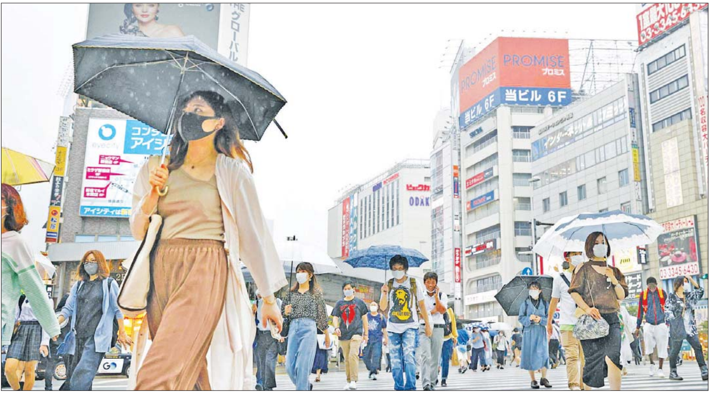
ဂျပန်နိုင်ငံ၌ ကိုဗစ်-၁၉ ကာလအတွင်း ပါးစပ်၊ နှာခေါင်းစည်းတပ်ဆင်သွားလာနေသူများကို တွေ့ရစဉ်။

ကျွမ်းကျင်သူတွေကတော့ ဒါကို အန္တရာယ် အများဆုံးဖြစ်နိုင်ခြေရှိတယ်လို့ ပြောကြားထားပါ တယ်။ ပြည်သူတွေ တစ်ဦးနဲ့တစ်ဦး နီးကပ်စွာ စကားပြောဆိုဆက်ဆံမယ်ဆိုရင် ဒါဟာ ပြဿနာ