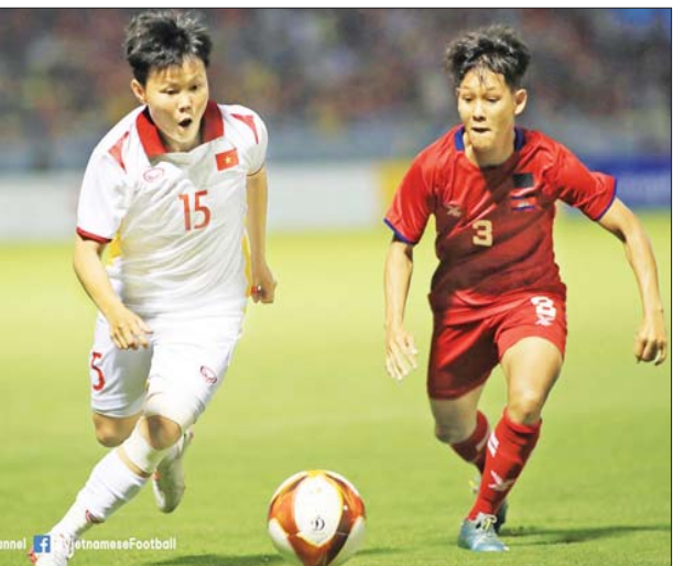
အမျိုးသမီးဘောလုံးပြိုင်ပွဲတွင် ဗီယက်နမ်နှင့် ကမ္ဘောဒီးယားအသင်း ယှဉ်ပြိုင်နေစဉ်။

အမျိုးသမီး ဘောလုံးပြိုင်ပွဲ အုပ်စု(က) နောက်ဆုံးနေ့တွင် အိမ်ရှင် ဗီယက်နမ်အသင်းက ကမ္ဘောဒီးယားအသင်းကို ခုနစ်ရိုး ပြတ် အနိုင်ရခဲ့သည်။ ဗီယက်နမ် အသင်းသည် ပထမပိုင်းတွင် တစ်ရိုးသာသွင်းယူနိုင်သော်လည်း ဒုတိယပိုင်းတွင် ခြောက်ရိုးထပ်မံ သွင်းယူခဲ့ခြင်းဖြစ်သည်။