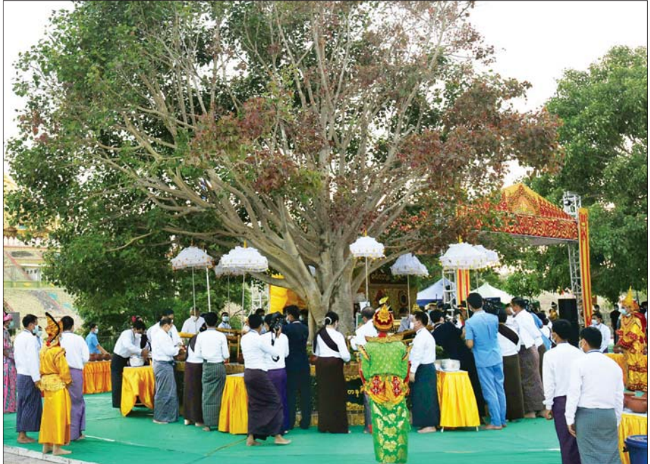
ကဆုန်ညောင်ရေသွန်းပွဲတော်တွင် နေပြည်တော် ဥပျာတသန္တိစေတီတော်မြတ်ကြီး ပရိဝုဏ်တော် မြောက်ဘက်အရပ်ရှိ မဟာဗောဓိညောင်ပင်တော်များအား ညောင်ရေသွန်းလောင်း ပူဇော်နေကြစဉ်။