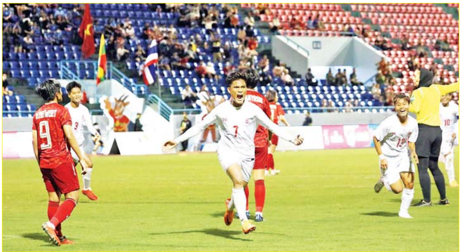
ဆီးဂိမ်းပြိုင်ပွဲဝင် မြန်မာအမျိုးသမီး ဘောလုံးအသင်း။

အမျိုးသားဘောလုံးပြိုင်ပွဲတွင် အုပ်စု (က) နောက်ဆုံးနေ့ပွဲစဉ်များ ကျင်းပမည်ဖြစ်ပြီး မြန်မာစံတော်ချိန် ညနေ ၃ နာရီခွဲတွင် မြန်မာနှင့် အင်ဒိုနီးရှား၊ မြန်မာစံတော်ချိန် ညနေ ၆ နာရီခွဲတွင် အိမ်ရှင်ဗီယက်နမ်အသင်းနှင့် တီမောအသင်းတို့ ယှဉ်ပြိုင်ကစားမည်ဖြစ်သည်။ မေ ၁၃ ရက် ပွဲစဉ်များအပြီးတွင် ဗီယက်နမ်အသင်းက သုံးပွဲကစား ခုနစ်မှတ်၊ မြန်မာနှင့် အင်ဒိုနီးရှားအသင်းက သုံးပွဲ ကစား ခြောက်မှတ်စီရထားပြီး ဆီမီးဖိုင်နယ် တက်ရောက်ရန် အပြိုင်ဖြစ်နေသည်။ ပွဲကုန်လေးပွဲ ကစား လေးမှတ်ရရှိသည့် ဖိလစ်ပိုင်အသင်း၊ သုံးပွဲ ကစား ရမှတ်မရသေးသည့် တီမောအသင်းတို့မှာ အုပ်စုအဆင့်ဖြင့် ကျေနပ်ခဲ့ရသည်။ ထို့ကြောင့် ဆီမီး ဖိုင်နယ် တက်ရောက်ခွင့်အတွက် အသင်းသုံးသင်း အပြိုင်ဖြစ်နေသော်လည်း တီမောနှင့်ကစားရမည့် အိမ်ရှင်ဗီယက်နမ်အသင်းမှာ ဆီမီးဖိုင်နယ် တက်ရောက်ရန် သေချာသလောက်ရှိနေသည်။ လက်ကျန်တစ်နေရာအတွက် ခြောက်မှတ်စီရထား