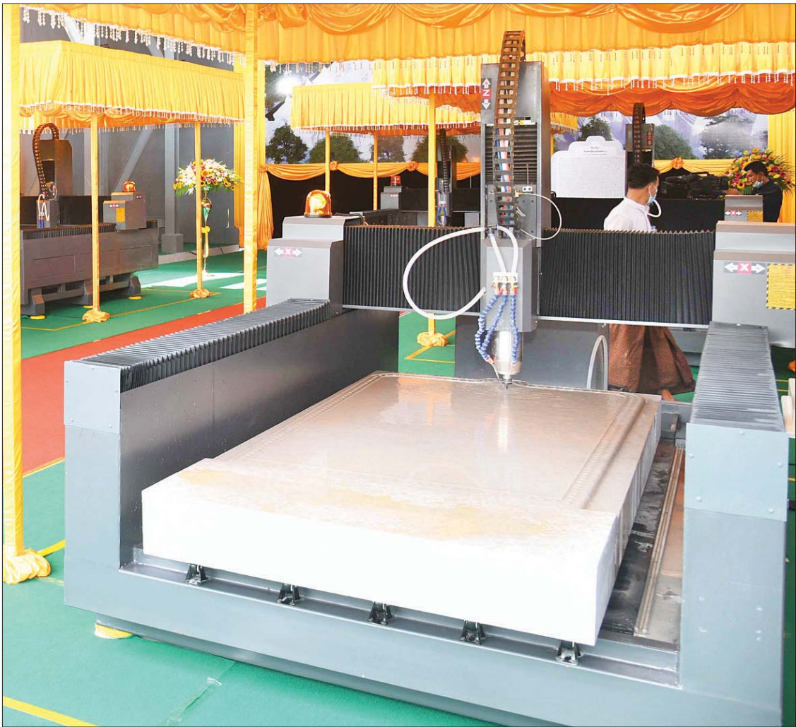
ပိဋကတ်ကျောက်စာတော်များကို စက်ယန္တရားများဖြင့် ရေးထိုးပူဇော်စဉ်။

သမိုင်းမော်ကွန်းကျောက်စာထားရှိမည့် အလယ်ဗဟို ကျောက်စာရုံ စေတီသည် အလျား ၂၁ ပေ၊ အနံ ၂၁ ပေ၊ အမြင့် ၂၇ ပေ ရှိမည်ဖြစ်ပြီးအခြား ကျောက်စာရုံ စေတီများအနေဖြင့် အလျား ၁၂ ပေ၊ အနံ ၁၂ ပေ၊ အမြင့် ၁၈ ပေ ရှိမည်ဖြစ်ကာ ကျောက်စာချပ်အနေဖြင့် အလျား ၄၅ လက်မ၊ အမြင့် ၆ ပေ ၃ လက်မ၊ ထု ၇ ဒသမ ၂ လက်မ ရှိမည်ဖြစ်ကြောင်း၊ ယခုပိဋကတ် ကျမ်းစာတော်များကို ရေးထိုးပူဇော်ပြီးပါကလည်း ကျောက်စာ ချပ်များသည် ဗုဒ္ဓမြတ်စွာ၏ မုခပိဋတော် များကို ရေးထိုးပူဇော်ထားခြင်းဖြစ်သည့် အတွက် မာရဝိဇယ ဗုဒ္ဓရုပ်ပွားတော်မြတ် ကြီး၏ မျက်နှာတော်မူရာ ရှေ့မျက်နှာစာ၌ စိုက်ထူပူဇော်ထားရှိမည်ဖြစ်၍ ဘုရားဖူး လာ မိဘပြည်သူများအနေဖြင့် ဗုဒ္ဓ ရုပ်ပွားတော်မြတ်ကြီးအား လာရောက် ဖူးမြော်ရာတွင် ကျောက်စာရုံစေတီများ အတွင်းရှိ ဘုရားဟောဒေသနာတော်များ ကို ပြည့်စုံစွာ ကြည့်ညိဉ္ဇေလောနိုင်ရေး စီစဉ်ဆောင်ရွက်သွားမည်ဖြစ်ကြောင်း၊ ယင်းသို့ ရေးထိုးပူဇော်နိုင်ရေး ဆောင်ရွက် ရာတွင် ကျမ်းစာတော်များကို စကျင် ကျောက်တော်များ၌ ခေတ်စီစက်ကိရိယာ များ အသုံးပြု၍ ပိဋအက္ခရာ၊ Romanize Language တို့ဖြင့်ရေးထိုးပူဇော်သွားမည် ဖြစ်ကြောင်း သတင်းရရှိသည်။ သတင်းစဉ်