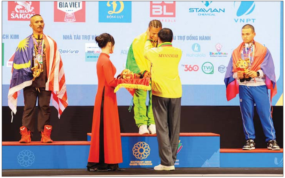
ပြည်ထောင်စုဝန်ကြီး ဦးမင်းသိန်းဇော် ကာယဗလ ကာယအလှ အားကစားပြိုင်ပွဲ ရွှေတံဆိပ်ဆုရ မောင်ရဲထွန်းနောင်အား ဆုချီးမြှင့်ပေးစဉ်။

ရရှိထားပြီး စုစုပေါင်း ဆုတံဆိပ် ၄၂ ခုဖြင့် နိုင်ငံအလိုက်အဆင့် ၇ ရပ်တည်မှု အဆင့် (၇) တွင် ရပ်တည်လျက်ရှိကြောင်း သိရ သတင်းစဉ်