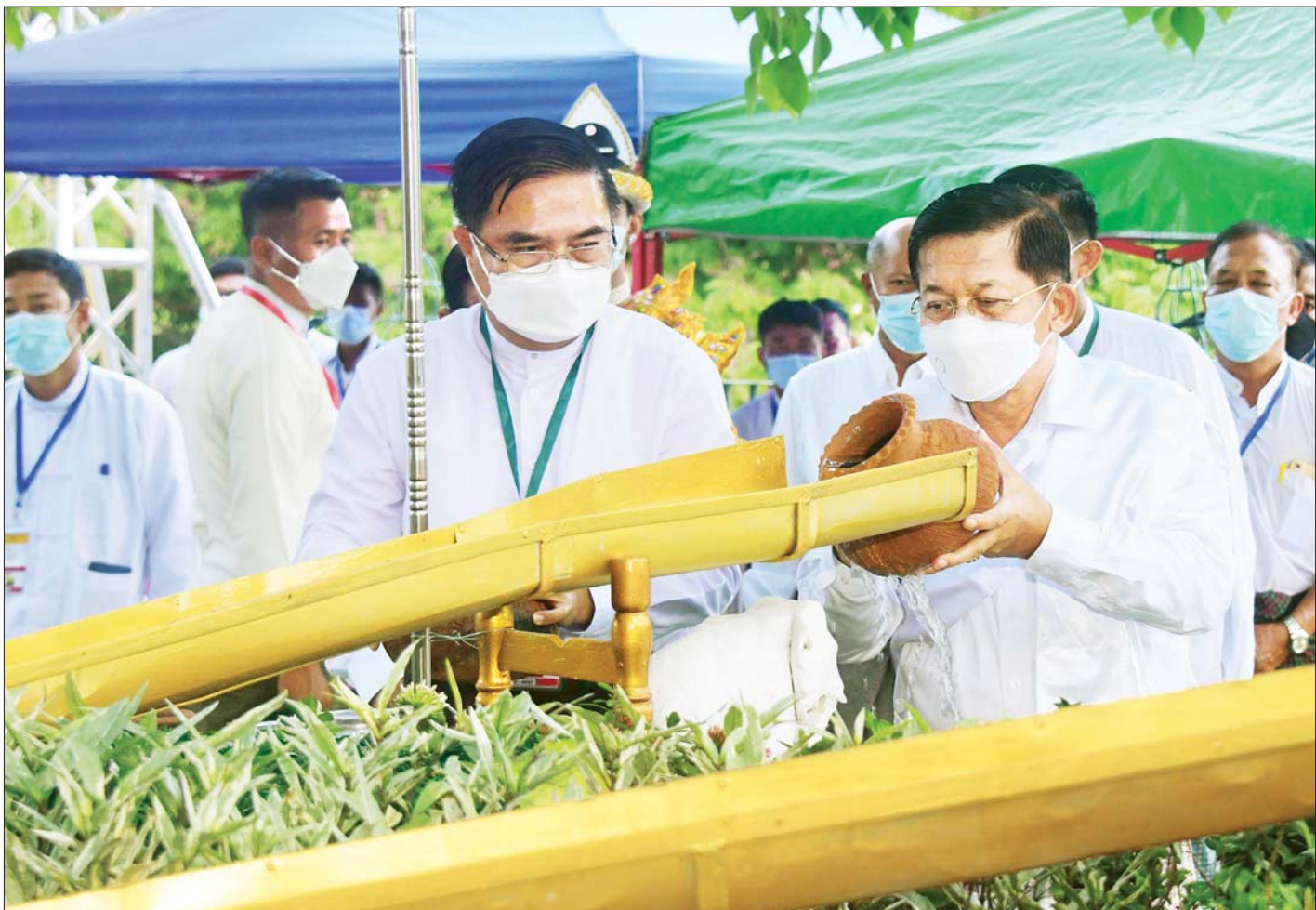
စာမျက်နှာ ၃ ကော်လံ ၁ ❖

နေပြည်တော် မေ ၁၄ ဗုဒ္ဓဘာသာမြန်မာလူမျိုးတို့၏ ၁၂ လရာသီ ပွဲတော်တွင် တစ်ခုအပါအဝင်ဖြစ်သည့် မြန်မာ သက္ကရာဇ် ၁၃၈၄ ခုနှစ် ကဆုန်လပြည့်(ဗုဒ္ဓနေ့) ဖြစ်သော ယနေ့ကျရောက်သည့် ကဆုန်ညောင်ရေ သွန်းပွဲတော်တွင် နေပြည်တော် ဥပျာတသန္တိစေတီတော်မြတ်ကြီး ပရိသတ်တော်မြောက်ဘက်အရပ်ရှိ မဟာဗောဓိညောင်ပင်တော်များအား (၁၄) ကြိမ်မြောက် ကဆုန်ညောင်ရေသွန်းလောင်းပူဇော်ခြင်း မဟာမင်္ဂလာအခမ်းအနားကို ယနေ့ ညနေပိုင်း၌ ကျင်းပပြုလုပ်ရာ နိုင်ငံတော်စီမံအုပ်ချုပ်ရေးကောင်စီ ဥက္ကဋ္ဌ နိုင်ငံတော်ဝန်ကြီးချုပ် ဗိုလ်ချုပ်မှူးကြီး မင်းအောင်လှိုင် အမှူးပြုသည့် နိုင်ငံတော်စီမံအုပ်ချုပ်ရေးကောင်စီဝင်များနှင့် ဇနီးများက မဟာဗောဓိညောင်ပင်တော်များကို ညောင်ရေသွန်းလောင်းပူဇော်ကြသည်။