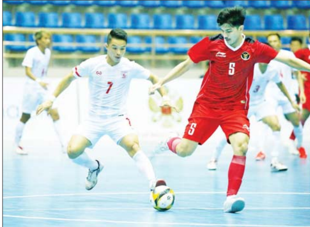
မြန်မာနှင့် အင်ဒိုနီးရှားအသင်း ယှဉ်ပြိုင်နေစဉ်။

ရန်ကန်ရတော့မည်ဖြစ်သည်။ မြန်မာအသင်းသည် အုပ်စု ဒုတိယပွဲအဖြစ် မေ ၁၆ ရက်တွင် ထိုင်းအသင်းနှင့် ကစားရမည်ဖြစ် သည်။ အုပ်စုဒုတိယနေ့အပြီးတွင် အင်ဒိုနီးရှားနှင့် အိမ်ရှင်ဗီယက်နမ် အသင်းတို့က နှစ်ပွဲကစား လေးမှတ်စီ၊ ထိုင်းအသင်းက တစ်ပွဲကစား သုံးမှတ်ရထားပြီး တစ်ပွဲကစားထားသည့် မြန်မာနှင့် နှစ်ပွဲကစားထားသည့် မလေးရှား အသင်းတို့မှာ ရှုံးပွဲကြုံတွေ့ထား ပြီး အမှတ်မရသေးပေ။ ရဲရင့်လွင်၊ ဓာတ်ပုံ - MFF