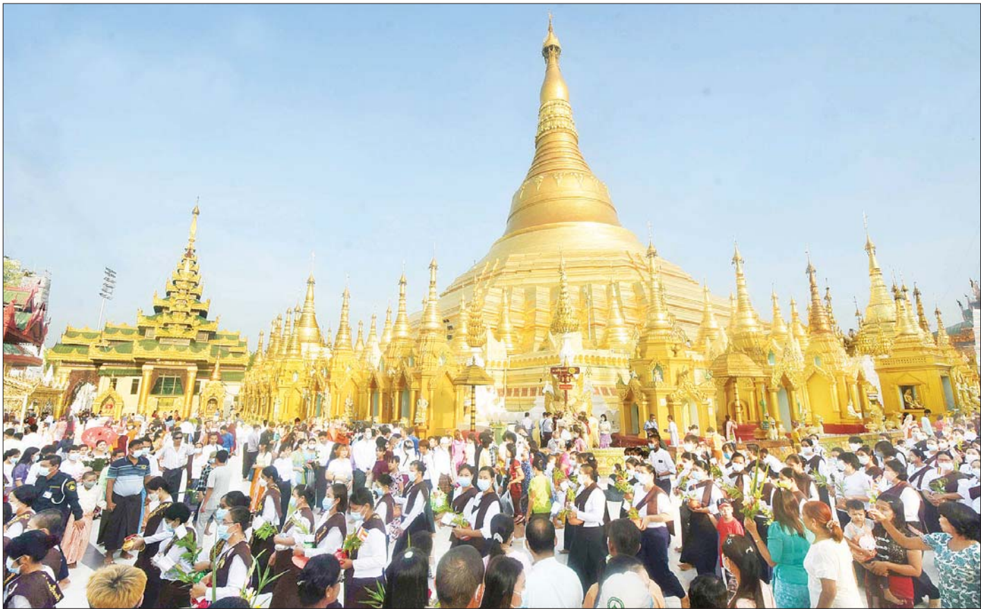
ကဆုန်လပြည့်နေ့(ဗုဒ္ဓနေ့)၌ ရွှေတိဂုံစေတီတော်မြတ်ကြီးတွင် ဘုရားဖူးလာပြည်သူများဖြင့် စည်ကားများပြားလျက်ရှိသည်ကို တွေ့ရစဉ်။

ထို့နောက် ရွှေတိဂုံစေတီတော်ဘဏ္ဍာတော်ထိန်း ဂေါပကအဖွဲ့ အလှည့်ကျသဘာပတိက ဗောဒိရုက္ခဥဒကပူဇော်မင်္ဂလာကို လျှောက်ထားသည်။