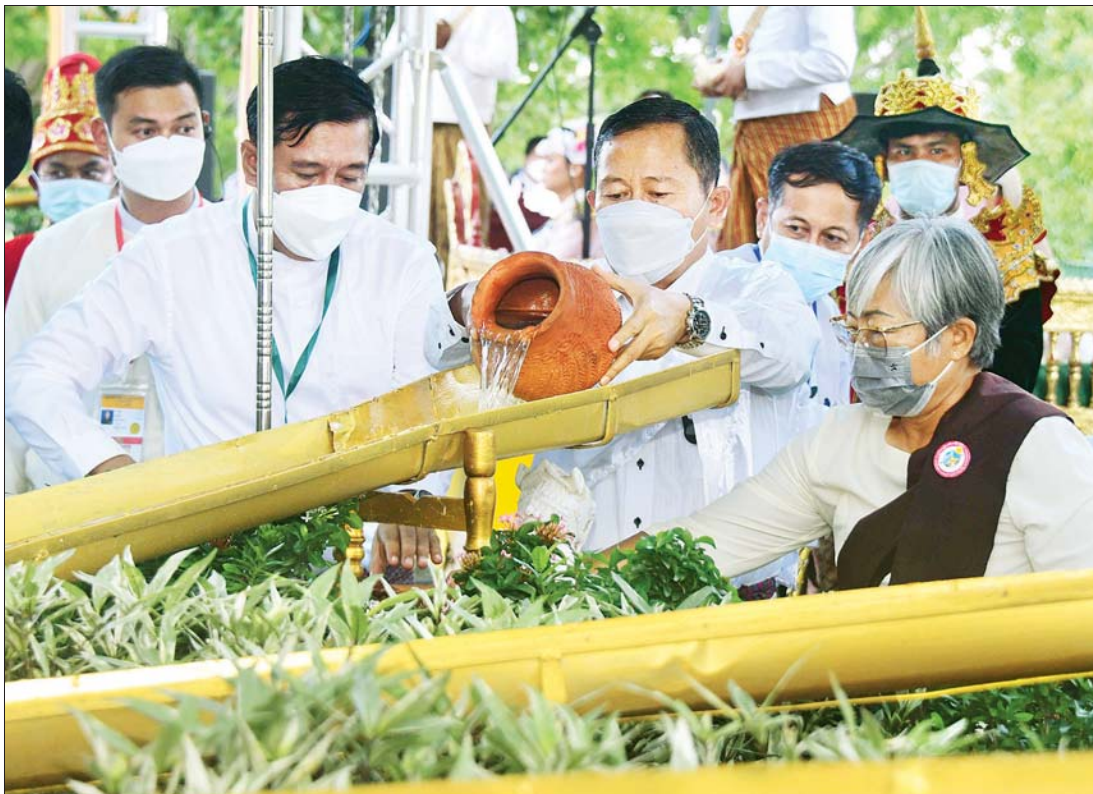
နိုင်ငံတော်စီမံ အုပ်ချုပ်ရေးကောင်စီ ဒုတိယဥက္ကဋ္ဌ ဒုတိယဝန်ကြီးချုပ် ကာကွယ်ရေး ဦးစီးချုပ်(ကြည်း) ဒုတိယဗိုလ်ချုပ်မျိုးကြီး စိုးဝင်းနှင့်ဇနီး ဒေါ်သန်းသန်းနွယ် ကဆုန်ညောင်ရေသွန်း ပွဲတော်တွင် နေပြည်တော် ဥပျာတသန္တိ စေတီတော်မြတ်ကြီး ပရိဝုဏ်တော် မြောက်ဘက်အရပ်ရှိ မဟာဗောဓိ ညောင်ပင်တော်များအား ညောင်ရေသွန်းလောင်း ပူဇော်စဉ်။

အခမ်းအနားသို့ နိုင်ငံတော်စီမံအုပ်ချုပ်ရေး ကောင်စီဥက္ကဋ္ဌ နိုင်ငံတော်ဝန်ကြီးချုပ် ဗိုလ်ချုပ် မျိုးကြီး မင်းအောင်လှိုင်နှင့်အတူ နိုင်ငံတော်စီမံ အုပ်ချုပ်ရေးကောင်စီ ဒုတိယဥက္ကဋ္ဌ ဒုတိယဝန်ကြီး ချုပ် ကာကွယ်ရေးဦးစီးချုပ်(ကြည်း) ဒုတိယဗိုလ်ချုပ် မျိုးကြီး စိုးဝင်းနှင့်ဇနီး ဒေါ်သန်းသန်းနွယ်၊ ကောင်စီ အဖွဲ့ဝင်များနှင့်ဇနီးများ၊ အတွင်းရေးမှူးနှင့်ဇနီး၊ တွဲဖက်အတွင်းရေးမှူးနှင့်ဇနီး၊ ပြည်ထောင်စု တရား သူကြီးချုပ်၊ နိုင်ငံတော်ဖွဲ့စည်းပုံအခြေခံဥပဒေဆိုင်ရာ ခုံရုံးဥက္ကဋ္ဌနှင့်ဇနီး၊ ပြည်ထောင်စုရွေးကောက်ပွဲ ကော်မရှင်ဥက္ကဋ္ဌ၊ ပြည်ထောင်စုဝန်ကြီးများနှင့် ဇနီးများ၊ ပြည်ထောင်စုစာရင်းစစ်ချုပ်နှင့် ဇနီး၊ နေပြည်တော်ကောင်စီဥက္ကဋ္ဌ၊ မြန်မာနိုင်ငံ အမျိုးသား လူ့အခွင့်အရေးကော်မရှင်ဥက္ကဋ္ဌ၊ ညှိနှိုင်းကွပ်ကဲရေး မျိုး(ကြည်း၊ ရေ၊ လေ)နှင့် ဇနီး၊ နေပြည်တော်တိုင်းစစ် ဌာနချုပ် တိုင်းမှူးနှင့်ဇနီးနှင့် တာဝန်ရှိသူများ၊ ဝတ်အသင်းအဖွဲ့များ တက်ရောက်ကြသည်။