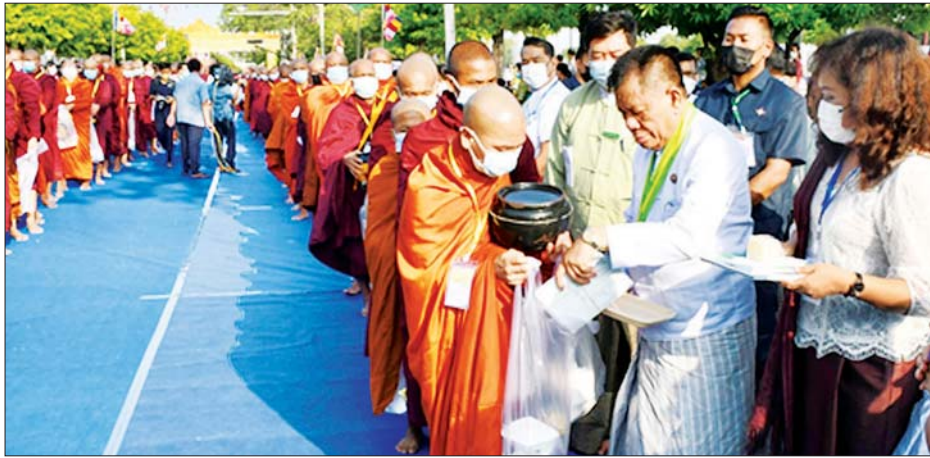
မန္တလေးတိုင်းဒေသကြီးဝန်ကြီးချုပ် ဦးမောင်ကို သံဃာတော်များအား လှူဖွယ်ပစ္စည်းများ ဆက်ကပ်လှူဒါန်းစဉ်။

သာသနာတော်နှစ် ၂၅၆၆ ခုနှစ် အထိမ်းအမှတ် မန္တလေးမြို့ လေးပြင်လေးရပ်ရှိ သံဃာတော်အပါး ၁၀၂၆၄ ပါးတို့အား ဆွမ်းနှင့် နဝကမ္မဝတ္ထုပစ္စည်းများ လောင်းလှူပူဇော်ခြင်း မဟာမင်္ဂလာကို ယနေ့နံနက်ပိုင်းက မန္တလေးမြို့ ကျီးအရှေ့ဘက်၊ အနောက်ဘက်၊ တောင်ဘက်၊ မြောက်ဘက်တို့ရှိ သတ်မှတ်မင်္ဂလာမဏ္ဍပ်များ၌ တစ်ချိန်တည်း တစ်ပြိုင်တည်းပြုလုပ်ကြရာ မန္တလေးမြို့ မဟာဒမ္မိကာရာမကျောင်းတိုက်၊ မိတ္ထီလာကျောင်းတိုက် ဆရာတော် နိုင်ငံတော်ဩဝါဒါစရိယ အဂ္ဂမဟာပဏ္ဍိတ ဘဒ္ဒန္တသုဇနဝိယ အမှူးပြုသော သံတော်များ ကြွရောက်တော်မူကြပြီး မန္တလေးတိုင်းဒေသကြီး ဝန်ကြီးချုပ်ဦးမောင်ကို၊ အလယ်ပိုင်းတိုင်းစစ်ဌာနချုပ် တိုင်းမှူးဗိုလ်ချုပ်ကိုကိုဦး၊ အစိုးရအဖွဲ့ဝင်ဝန်ကြီးများ၊ ဌာနဆိုင်ရာများ၊ လူမှုအသင်းအဖွဲ့များ၊ အလှူရှင်များနှင့် စေတနာရှင်ပြည်သူများ တက်ရောက်ကြည့်ညို့