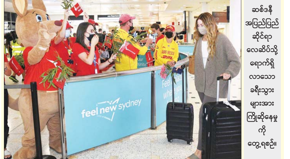
ဆစ်ဒနီ အပြည်ပြည် ဆိုင်ရာ လေဆိပ်သို့ ရောက်ရှိ လာသော ခရီးသွား များအား ကြိုဆိုနေမှု ကို တွေ့ရစဉ်။