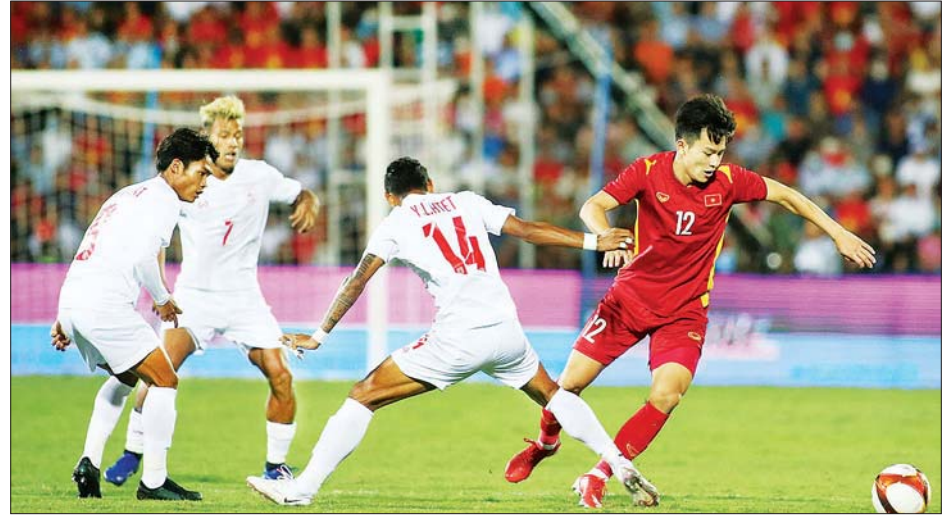
မြန်မာနှင့် ဗီယက်နမ်အသင်း ယှဉ်ပြိုင်နေစဉ်။