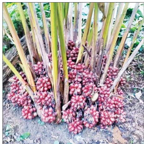
တရုတ်ဟင်းမွေးမဆလာထုတ်လုပ်ရန် စိုက်ပျိုး ထားသော ရှာကောပတ်ကောပင်။

စဉ်ဆက်မပြတ်ပို့ချပေးပါက မကြာမီ ဒေသခံပြည်သူ များ လိုလားသည့် လူသားအရင်းအမြစ်နှင့်နည်းပညာ များပေါင်းစပ်၍ အသက်မွေးဝမ်းကျောင်းသင်တန်း များ ဖွံ့ဖြိုးလာ၍ ဒေသ၏သဘာဝထွက်ကုန် အလွန်အကျွံမိုသိုအားထားခြင်း လျော့နည်းလာမည် ဖြစ်ပြီး သဘာဝအခြေခံခရီးသွားလုပ်ငန်းများမှ အလုပ်အကိုင်အခွင့်အလမ်းနှင့် ဒေသခံပြည်သူများ ဝင်ငွေတိုးတက်ရရှိလာမည်ဖြစ်ကြောင်း သိရသည်။ ဖုန်ကန်(ပူတာအို)