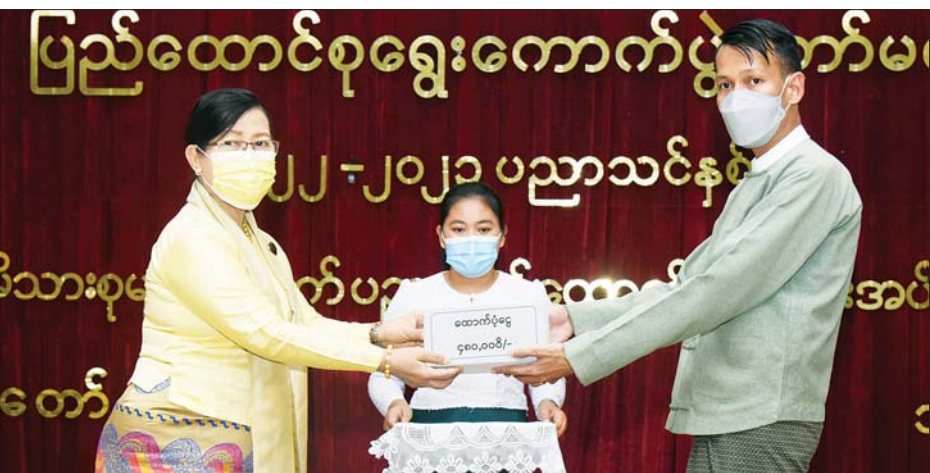
အခမ်းအနားတွင် ပြည် သား ကျောင်းသူအရေအတွက်မှာ ကျောင်းသူ ၄၃၇ ဦးနှင့် တက္ကသိုလ် ထောင်စု ရွေးကောက်ပွဲကော်မရှင် မူလတန်း၊ အလယ်တန်း၊ အထက် အဆင့် တက်ရောက်ပညာ အဖွဲ့ဝင် ဒေါ်နန္ဒာမာလာ ပညာသင် တန်းအဆင့် တက်ရောက်ပညာ သင်ကြားမည့် ကျောင်းသား ကျောင်းသား ကျောင်းသူ ၅၁ ဦး၊ စုစုပေါင်း ၄၈၈

ပြည်ထောင်စု ရွေးကောက်ပွဲ ကော်မရှင်အနေဖြင့် ၂၀၂၂-၂၀၂၃ ပညာသင်နှစ်တွင် တက်ရောက် ပညာသင်ကြားကြ မည့် ပြည်ထောင်စုရွေးကောက်ပွဲ ကော်မရှင်ရုံးနှင့် ကော်မရှင်အဖွဲ့ခွဲ အဆင့်ဆင့်တို့မှ ဝန်ထမ်းမိသားစု များ၏သားသမီး ကျောင်းသား ကျောင်းသူများ ပညာသင် ထောက်ပံ့ငွေပေးအပ်ပွဲ အခမ်း အနားကို ယနေ့နံနက် ၉ နာရီခွဲ တွင်နေပြည်တော်ရှိပြည်ထောင်စု ရွေးကောက်ပွဲ ကော်မရှင်ရုံး အစည်းအဝေးခန်းမ၌ ကျင်းပ သည်။