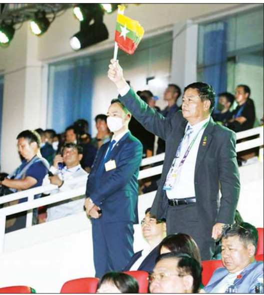
ဗီယက်နမ်နိုင်ငံသည် အရှေ့တောင်အာရှ အားကစားပြိုင်ပွဲကို ၂၀၀၃ ခုနှစ်က အိမ်ရှင်အဖြစ် ပထမအကြိမ် လက်ခံကျင်းပခဲ့ပြီး ယခု ဒုတိယ