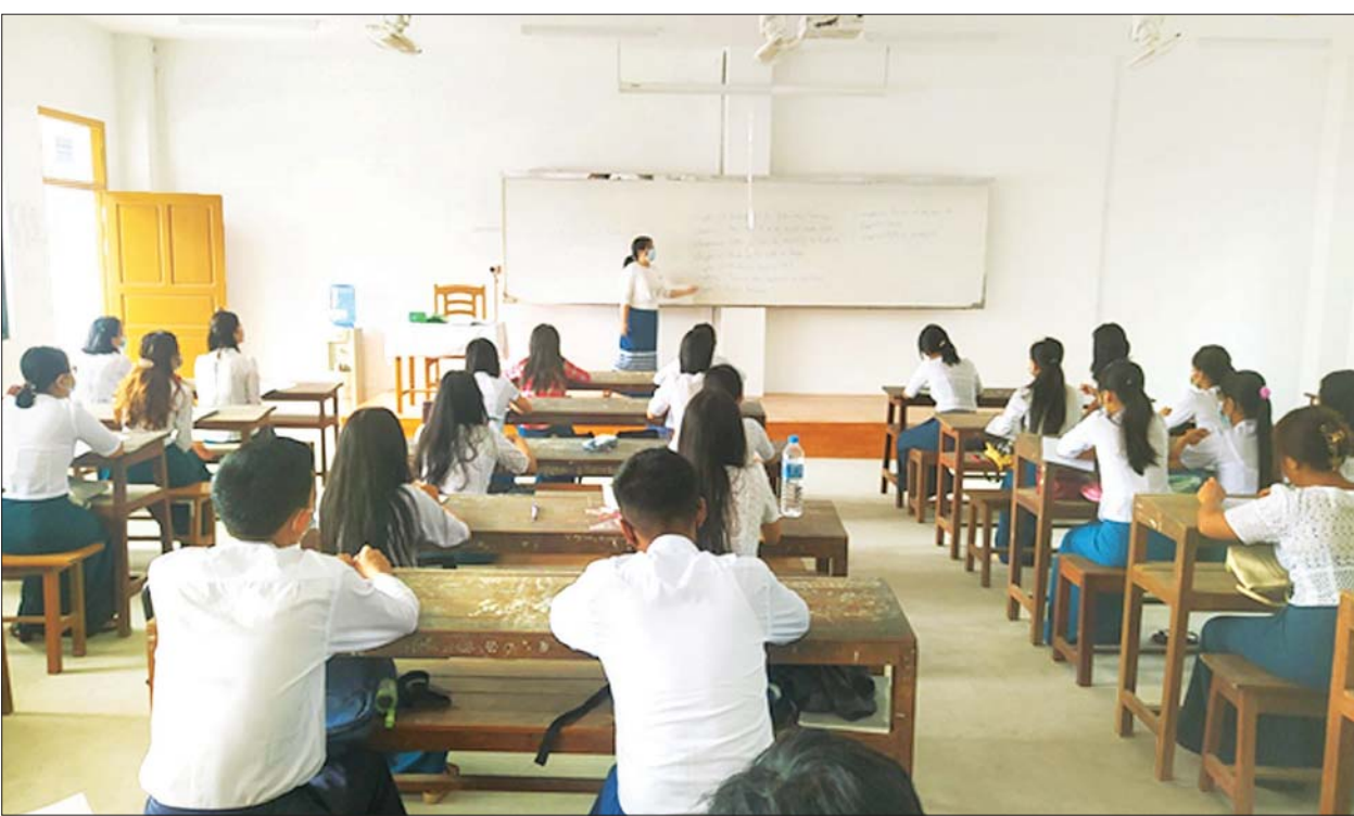
တောင်ငူမြို့ ကွန်ပျူတာတက္ကသိုလ်၌ ကျောင်းသား ကျောင်းသူများ အေးချမ်းစွာ ပညာသင်ကြားနေမှုကို တွေ့ရစဉ်။