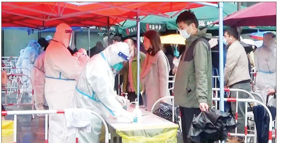
ကိုဗစ်-၁၉ ကူးစက်ဖြစ်ပွားမှုကို ကာကွယ်ရေးလုပ်ငန်းများ ဆောင်ရွက်စဉ်။