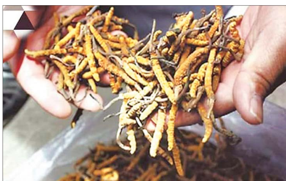
ဒေသထွက် ဆေးဖက်ဝင် ရိုးပတီး။

“ဖုန်ကန်ရာဇီရေခဲတောင်ဟာ အိန္ဒိယနဲ့ မြန်မာ နိုင်ငံ နယ်စပ်ဒေသရေခဲတောင်ဧရိယာ ဖြစ်ပါတယ်။ ဒေသခံပြည်သူများစုမှာ မိရိုးဖလာတောင်ယာ လုပ်ငန်း၊ အမဲလိုက်ခြင်းနဲ့ ဒေသထွက်သီးနှံတွေကို ထုတ်လုပ်ရောင်းချပြီး အသက်မွေးဝမ်းကျောင်း ပြုကြပေမယ့် ရေရှည်မှာ သဘာဝပတ်ဝန်းကျင်