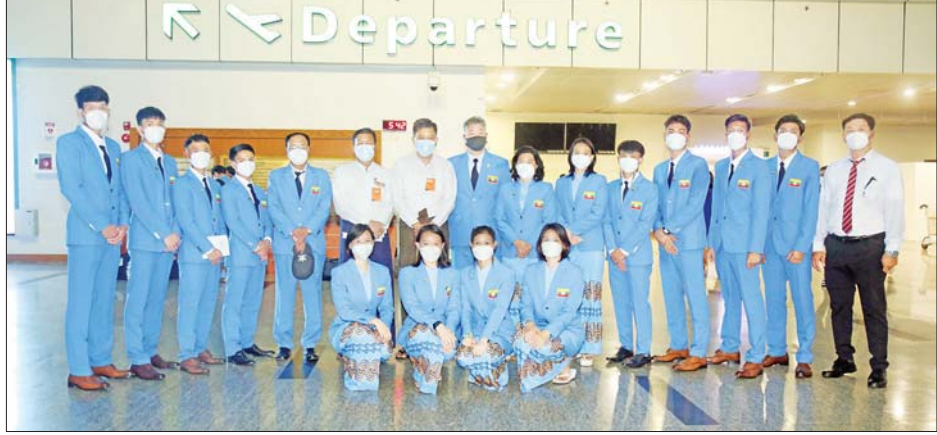
တိုက်ကွမ်ဒိုအားကစားအဖွဲ့ကို တွေ့ရစဉ်။

ရန်ကုန် မေ ၁၃ ကျင်းပပြုလုပ်မည့် (၃၁) ကြိမ် ရန်အတွက် မြန်မာအားကစား ဗီယက်နမ်နိုင်ငံ ဟန့်ရှိုမြို့ မြောက် အရှေ့တောင်အာရှ အဖွဲ့ စတုတ္ထအသုတ်သည် နှင့် အခြားဆက်စပ်မြို့များတွင် အားကစားပြိုင်ပွဲသို့ ပါဝင်ယှဉ်ပြိုင် ယနေ့နံနက် ၇ နာရီတွင် ဗီယက်