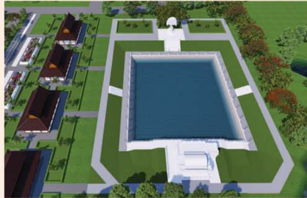
ကျောက်စာရုံစေတီ(၁၂ x ၁၂ x ၁၈)ပေ ၁ ဆူ တန်ဖိုး-၂၇၉ သိန်း