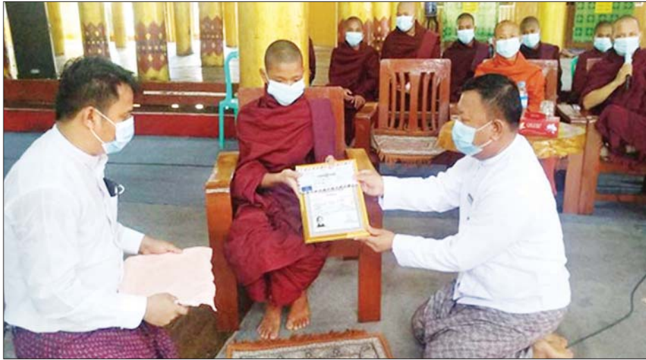
ထို့နောက် တက်ရောက်လာကြသူများက သံဃာတော်များနှင့် စာအောင်သံဃာတော်များအား သင်္ကန်း၊ လှူဖွယ်ဝတ္ထုပစ္စည်းများ၊ အောင်လက်မှတ်များနှင့် ဆုငွေများ ပေးအပ်ချီးမြှင့်ခြင်းပြုလုပ်ခဲ့ကြောင်း ရေစက်သွန်းချ အမျှပေးကြောင်း သံဃာတော်များအား နေ့ဆန်းများ