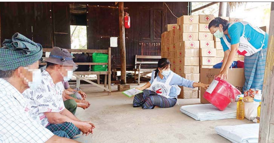
စိတ်ပိုင်းဆိုင်ရာ အားပေးကူညီခြင်းများကိုလည်း အတွက် စားနပ်ရိက္ခာများ၊ ရေနှင့် သန့်ရှင်းရေးသုံး ပြုလုပ်ကြသည်။ ပစ္စည်းများ၊ အခြားလိုအပ်သည့်ပစ္စည်းများကို အလားတူ အကူအညီလိုအပ်နေသည့် ယာယီ ဆက်လက်ထောက်ပံ့ကူညီနိုင်ရန် ဆောင်ရွက်လျက် ခိုလှုံရာစခန်းများနှင့် ကျေးရွာများမှ ပြည်သူများ ရှိကြောင်း သိရသည်။ သတင်းစဉ်

စစ်ကိုင်းတိုင်းဒေသကြီး စစ်ကိုင်း၊ ရွှေဘို၊ မုံရွာ၊ ကန့်ဘလူမြို့နယ် လေးမြို့နယ်မှ ယာယီခိုလှုံရေး စခန်း ငါးခုနှင့် ရွှေဘိုမြို့နယ်မှ ကျေးရွာနှစ်ရွာရှိ အိမ်ထောင်စု ၃၃၈ စု လူဦးရေ ၁၁၉၁ ဦးအတွက် ငွေကျပ် ၇၉၅၄၅၀၅၀ တန်ဖိုးရှိ ကနဦး အရေးပေါ် လိုအပ်ချက်များဖြစ်သည့် အစားအစာ (ဆန်၊ ဆီ၊ ဆား)၊ ပဲ၊ ငါး(သေတ္တာ) ၃၃၈ စုံ၊ နှာခေါင်းစည်း ၅၀ ပါ ဘူး၊ ၃၃၈ ဘူး၊ လက်သန့်ဆေးရည် ၃၃၈ ဘူး၊ မိသားစု သုံး တစ်ကိုယ်ရေသန့်ရှင်းရေးသုံးပစ္စည်း ၃၃၈ ပုံ၊ အမျိုးသမီး တစ်ကိုယ်ရေသန့်ရှင်းရေးသုံးပစ္စည်း ၃၂၅ ပုံ၊ အမျိုးသားတစ်ကိုယ်ရေသန့်ရှင်းရေးသုံး ပစ္စည်း ၃၂၆ ပုံ၊ မိုးကာအင်္ကျီ ၆၅၅ ထည်၊ တာပေါလင် ၆၇၆ ချပ်၊ အိမ်ဆောက်အထောက်အကူပြုပစ္စည်း ၁၆၈ အိတ်၊ မိသားစုသုံး ရေသန့်ပုံး (Life Straw) ခုနစ်ခု၊ ဂါလန် ၂၀၀ ဆုံ ရေပုံးခြောက်ပုံးတို့ကို သွားရောက်ထောက်ပံ့ ကူညီပေးခဲ့သည့်အပြင်