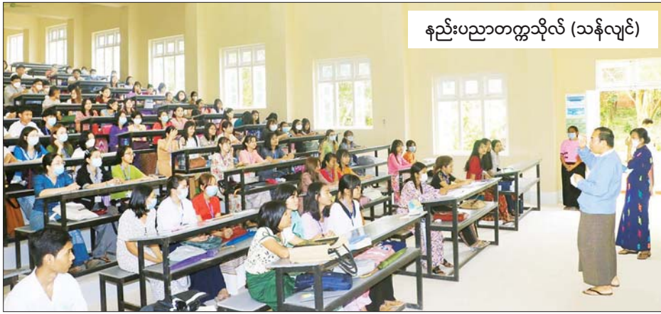
နည်းပညာတက္ကသိုလ် (သန်လျင်)