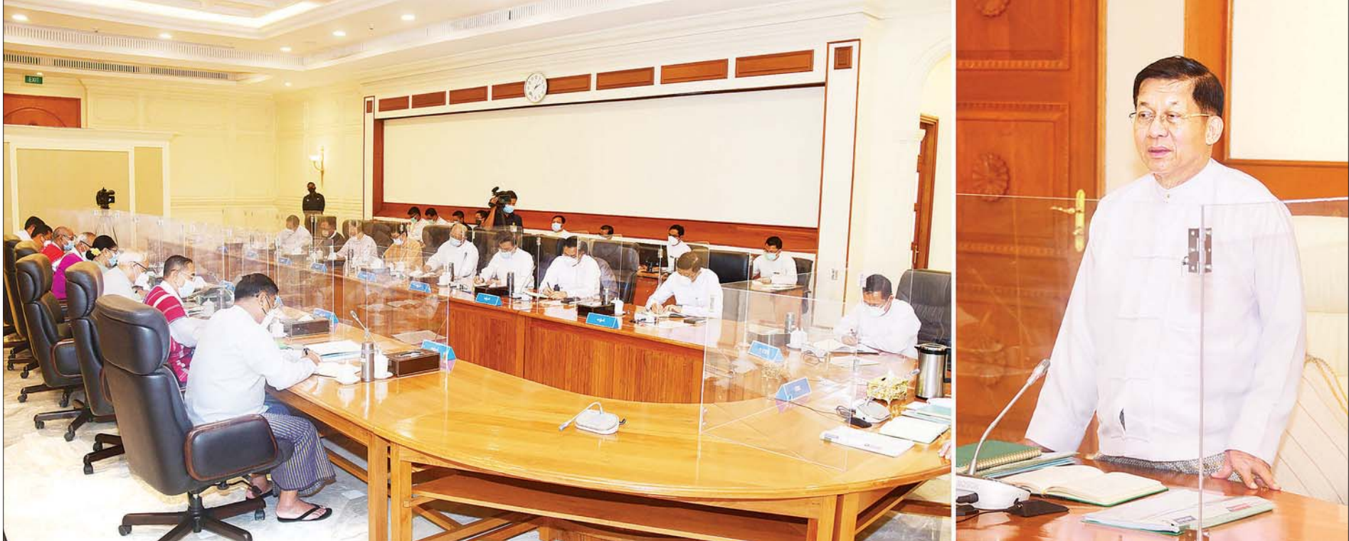
နိုင်ငံတော်စီမံအုပ်ချုပ်ရေးကောင်စီဥက္ကဋ္ဌ နိုင်ငံတော်ဝန်ကြီးချုပ် ဗိုလ်ချုပ်မှူးကြီး မင်းအောင်လှိုင် နိုင်ငံတော်စီမံအုပ်ချုပ်ရေးကောင်စီ အစည်းအဝေး (၄/၂၀၂၂) တွင် အမှာစကားပြောကြားစဉ်။

နေပြည်တော် မေ ၁၂ နိုင်ငံတော်စီမံအုပ်ချုပ်ရေးကောင်စီ အစည်းအဝေး (၄/၂၀၂၂) ကို ယနေ့ မွန်းလွဲပိုင်းတွင် နေပြည်တော်ရှိ နိုင်ငံတော်စီမံအုပ်ချုပ်ရေး ကောင်စီဥက္ကဋ္ဌရုံး အစည်းအဝေးခန်းမ၌ ကျင်းပရာ နိုင်ငံတော်စီမံ အုပ်ချုပ်ရေးကောင်စီဥက္ကဋ္ဌ နိုင်ငံတော်ဝန်ကြီးချုပ် ဗိုလ်ချုပ်မှူးကြီး မင်းအောင်လှိုင် တက်ရောက်အမှာ စကားပြောကြားသည်။ အစည်းအဝေးသို့ နိုင်ငံတော်စီမံအုပ်ချုပ်ရေးကောင်စီ ဒုတိယဥက္ကဋ္ဌ ဒုတိယဝန်ကြီးချုပ် ဒုတိယဗိုလ်ချုပ်မှူးကြီး စိုးဝင်း၊ ကောင်စီအဖွဲ့ဝင်များ ဖြစ်ကြသည့် ဗိုလ်ချုပ်ကြီး မြထွန်းဦး၊ ဗိုလ်ချုပ်ကြီး တင်အောင်စန်း၊ ဒုတိယဗိုလ်ချုပ်ကြီး မိုးမြင့်ထွန်း၊ မန်းငြိမ်းမောင်၊ ဦးသိန်းညွန့်၊ ဦးခင်မောင်ဆွေ၊ ဒေါ်အေးနုစိန်၊ Jeng Phang နော်တောင်၊ ဦးမောင်ဟာ၊ စာမျက်နှာ ၃ ကော်လံ ၁ ❊