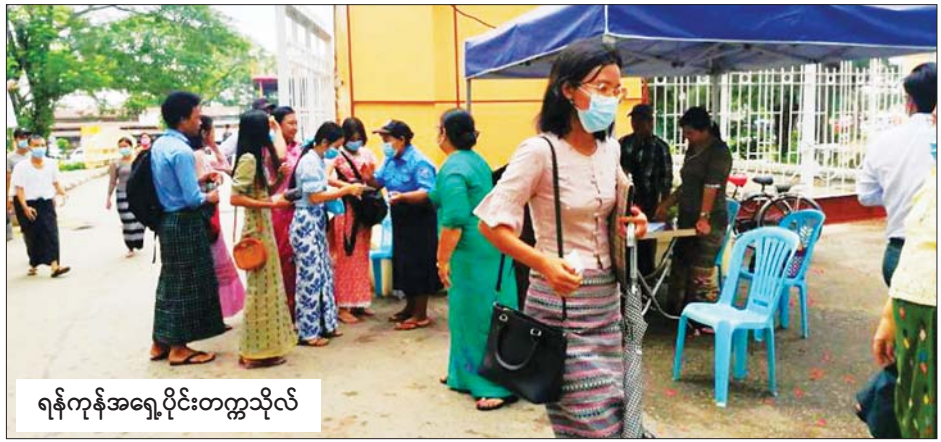
ရန်ကုန်အရှေ့ပိုင်းတက္ကသိုလ်