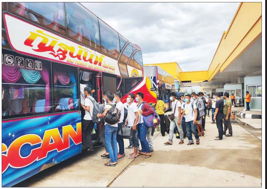
ထိုင်းနိုင်ငံသို့ MoU စနစ်ဖြင့် သွားရောက်လုပ်ကိုင်ရန် မြန်မာရွှေ့ပြောင်းလုပ်သားများ ထွက်ခွာစဉ်။

ထို့ကြောင့် ထိုင်းနိုင်ငံသို့ သွားရောက်အလုပ် လုပ်ကိုင်လိုသည့် မြန်မာနိုင်ငံသားများအနေဖြင့် တရားမဝင်သွားရောက်ခြင်းကြောင့် လူကုန်ကူးခံရခြင်း၊ လူ့အခွင့်အရေးချိုးဖောက်ခံရခြင်း၊ ဥပဒေနှင့်အညီ ကာကွယ်စောင့်ရှောက်မှုများ အပြည့်အဝမရရှိခြင်းနှင့် အခြားသော လူ့အခွင့်အရေးဆုံးရှုံးမှုများ ဖြစ်ပေါ်နိုင် သည့်အပြင် အခက်အခဲမျိုးစုံ ကြုံတွေ့လာနိုင်သဖြင့် တရားမဝင်သွားရောက်ခြင်းများ လုံးဝမပြုလုပ်ကြရန် နှင့် ပြည်ပသို့ တရားဝင်သွားရောက်လုပ်ကိုင်ခြင်းဖြင့်