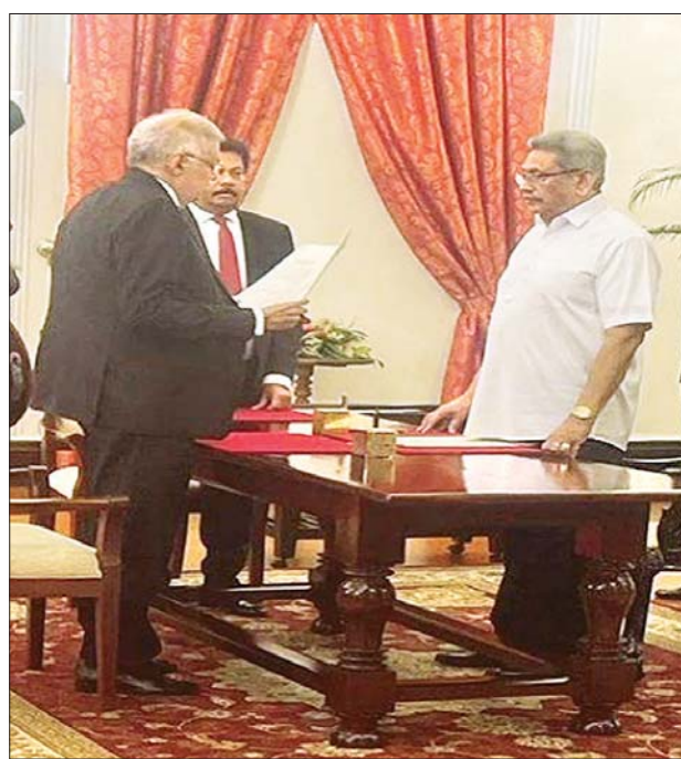
သီရိလင်္ကာနိုင်ငံ၏ ဝန်ကြီးချုပ်သစ်အဖြစ် ကျမ်းသစ္စာကျိန်ဆို ခဲ့သော အမျိုးသားစည်းလုံးညီညွတ်ရေးပါတီ (UNP) ခေါင်းဆောင် ရာနေးလ်ဝစ်ခဲရမ်ဆင်း။

ကိုလံဘို မေ ၁၂ သီရိလင်္ကာသမ္မတ ဂိုတာဘာယာရာဂျာပက်ဆာသည် အမျိုးသား စည်းလုံးညီညွတ်ရေးပါတီ (UNP) ခေါင်းဆောင် ရာနေးလ်ဝစ်ခဲရမ်ဆင်းကို မေ ၁၂ ရက်က ဝန်ကြီးချုပ်အဖြစ် ခန့်အပ်ခဲ့သည်။