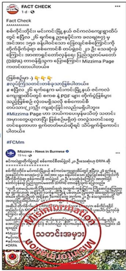
တွေ တောင်းခံနိုင်ဖို့အတွက် လုပ်ဆောင်နေခြင်းဖြစ်ပါတယ်။

တန်း ကားငါးစီးကို PDF မှ မိုင်းဆွဲတိုက်ခိုက်ခဲ့လို့ စစ်သား ၃၀ မှ ၄၀ ခန့် သေဆုံးခဲ့တယ်ဆိုတဲ့ သတင်းကလည်း မိုင်းဆွဲဖြစ်စဉ်မှန်ကန်သော်လည်း စစ်သည် နှစ်ဦးသာ ဒဏ်ရာရရှိပြီး ကျဆုံးမှုမရှိကြောင်း သိရှိရပါတယ်။ ထပ်ခါတလဲလဲ ထုတ်လွှင့်နေ ဒီလိုတွေ လုပ်ကြံသတင်းအတုတွေနဲ့ ပုံဖျက်သတင်းအမှားတွေကို ထပ်ခါတလဲလဲ ထုတ်လွှင့်နေရတဲ့ရည်ရွယ်ချက်က အကြမ်းဖက်အဖွဲ့အစည်းအဖြစ် သတ်မှတ်ခံထားရတဲ့ NUG ပြည်ပြေးအဖွဲ့ရဲ့ အလုံးစုံပျက်စီးရေးလမ်းစဉ်အရ နိုင်ငံအနှံ့အပြားမှာ တည်ငြိမ်အေးချမ်းမှုပျက်ပြားပြီး ငါတို့နိုင်ငံနေပြီဆိုတဲ့ လှုံ့ဆော်မှုကို ပြည်သူများ ယုံကြည်လာစေရန် လုပ်ဆောင်နေခြင်းဖြစ်ပါတယ်။ ဒါ့အပြင် မျှော်လင့်ချက်မဲ့ပြီး ဦးတည်ရာပျောက်ဆုံးနေတဲ့ အကြမ်းဖက် PDF တွေနဲ့ သူတို့ကို ထောက်ခံသူတွေ စိတ်ဓာတ်တက်ကြွလာစေဖို့၊ အကြမ်းဖက်မှုတွေကို ပိုမိုအားပေးလာစေဖို့ PDF များအတွက် အကြောင်းပြုပြီး ပြည်တွင်း၊ ပြည်ပကနေ ထောက်ပံ့ကြေးနဲ့ အလှူငွေ