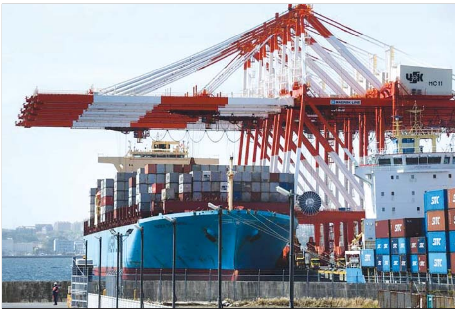
ဂျပန်နိုင်ငံသို့ သွင်းကုန်တင်သွင်းသည့် ကွန်တိန်နာ သင်္ဘောကြီးများ။

သည့် ရေနံနှင့်ကျောက်မီးသွေးတို့ဖြစ်သည်။ ရေနံ၊ သဘာဝဓာတ်ငွေ့နှင့် ကျောက်မီးသွေးစသည့် သွင်းကုန်တင်သွင်းမှုစရိတ်မှာ ပြီးခဲ့သည့်နှစ် ကာလတူ မတ်လထက် ၈၀ ရာခိုင်နှုန်း မြင့်တက်လာပြီး စားသောက်ကုန်တင်သွင်းမှုတွင် ၂၂ ရာခိုင်နှုန်း၊ ဓာတုဗေဒပစ္စည်းများ တင်သွင်းမှုတွင် ၄၂ ရာခိုင်နှုန်း ကျော် မြင့်တက်လာခဲ့သည်။ သွင်းကုန်အတွက် ကုန်ကျစရိတ်မြင့်တက်ပြီး ပို့ကုန်တွင် မော်တော်ယာဉ် တင်ပို့မှု ၁ ဒသမ ၂ ရာခိုင်နှုန်းကျဆင်းခဲ့ကာ အရေအတွက်အားဖြင့် မော်တော်ယာဉ် ၁၄ ရာခိုင်နှုန်းဝန်းကျင် ကျဆင်းလာခဲ့သည်။ အချို့သော မော်တော်ယာဉ်ထုတ်လုပ်သူ၊ စပ်ဆက်ပစ္စည်းထုတ်လုပ်သူများ လုပ်ငန်းရပ်နားထားရမှုများရှိနေပြီး အကျပ်အတည်းများ ကျော်လွန်သည့်ကာလတွင်မူ ဂျပန်ပို့ကုန်များ ပြန်လည်နာလန်ထူလာမည်ဟုလည်း ကျွမ်းကျင်သူများက ခန့်မှန်းကြကြောင်း ဂျပန်နေ့စဉ်သတင်းစာတွင် ရေးသားဖော်ပြထားသည်။