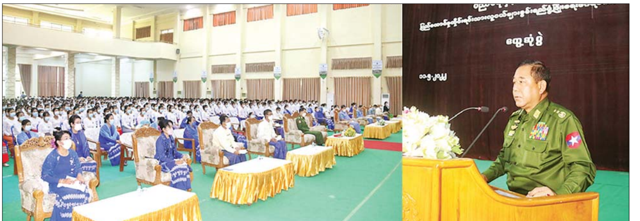
ပြည်ထောင်စုဝန်ကြီး ဒုတိယဗိုလ်ချုပ်ကြီးထွန်းထွန်းနောင် ပြည်ထောင်စုတိုင်းရင်းသားလူငယ်များ စွမ်းရည်ဖွံ့ဖြိုးရေးဒီဂရီကောလိပ်(ရန်ကုန်)၌ ကျောင်းအုပ်ကြီး၊ ဒုတိယကျောင်းအုပ်ကြီး၊ ညွှန်ကြားရေးမှူးများ၊ ပါမောက္ခများ၊ ဆရာ ဆရာမများ၊ ဝန်ထမ်းများ၊ ဝိဇ္ဇာ၊ သိပ္ပံ၊ AGTI အတန်းစုံမှ ကျောင်းသား ကျောင်းသူများအား တွေ့ဆုံအမှာစကားပြောကြားစဉ်။

ပြည်ထောင်စုဝန်ကြီးသည် ယနေ့ နံနက် ၉ နာရီတွင် ပြည်ထောင်စု