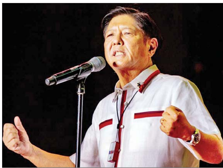
ဘုံဘုံဟု လူသိများသော သမ္မတဟောင်း ဖာဒီနန်မားကို့စ်၏ သားဖြစ်သူ ဖာဒီနန် မားကို့စ်ဂျူနီယာသည် ဖိလစ်ပိုင်နိုင်ငံ၏

အဆိုပါရွေးကောက်ပွဲတွင် မားကို့စ် ဂျူနီယာသည် ရေတွက်ပြီး မဲအရေ အတွက် ၉၈ ရာခိုင်နှုန်းတွင် မဲအရေ အတွက် ၁၆ သန်း ကျော်ဖြင့် ဦးဆောင် နိုင်ခဲ့ကြောင်း သိရသည်။ ထို့ကြောင့်