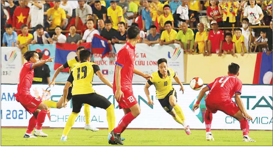
ဆီးဂိမ်းအမျိုးသားပြိုင်ပွဲတွင် မလေးရှားနှင့် လာအိုအသင်း ယှဉ်ပြိုင်နေစဉ်။