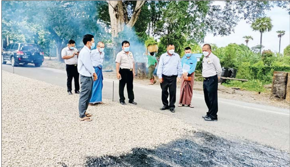
မှာကြားသည်။ ကြည့်ရှုစစ်ဆေး ထို့နောက် ဒုတိယဝန်ကြီးနှင့်အဖွဲ့သည် မိတ္ထီလာ- ကျောက်ပန်းတောင်းလမ်း မိုင် (၅၂/၃) နှင့် (၅၂/၄) အကြားတွင် လမ်းပေါက်ဖာ၊ လမ်းညှိခြင်း ဆောင်ရွက် နေမှုနှင့် မိုင်(၂၂/၄) နှင့် (၂၃/၀) ကြားရှိ လမ်းပေါက်ဖာ ခြင်း ဆောင်ရွက်နေမှုတို့ကို ကြည့်ရှုစစ်ဆေး သည်။ (အပေါ်ပုံ)

တင်ပြချက်များအပေါ် ဒုတိယဝန်ကြီးက ပခုက္ကူ- မိတ္ထီလာဘက်ရှိ တံတားများတွင် တန် ၁၆၀ အလေး ချိန် သယ်ဆောင်သည့်ယာဉ်များ ဖြတ်သန်းသွားလာ မှုရှိနေ၍ တံတားများ၏ ကြံ့ခိုင်မှုအား စစ်ဆေးရန်နှင့် ဝန်ကြီးဌာနမှ ပံ့ပိုးပေးရမည့် ကိစ္စရပ်များရှိပါက တာဝန်ရှိသူများနှင့် ညှိနှိုင်းပူးပေါင်းဆောင်ရွက်ရန်