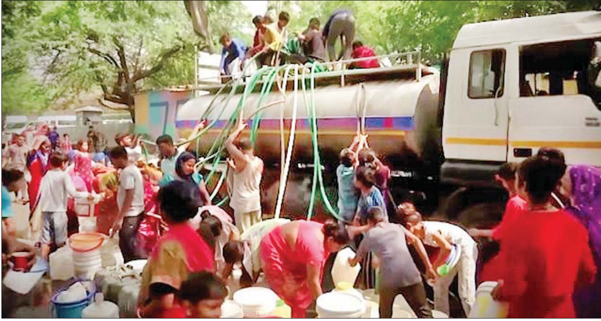
အိန္ဒိယနိုင်ငံတွင် ရေရရှိရန် တန်းစီစောင့်ဆိုင်းပြီး အလှူအယက်ရေယူနေသည်ကို တွေ့ရစဉ်။