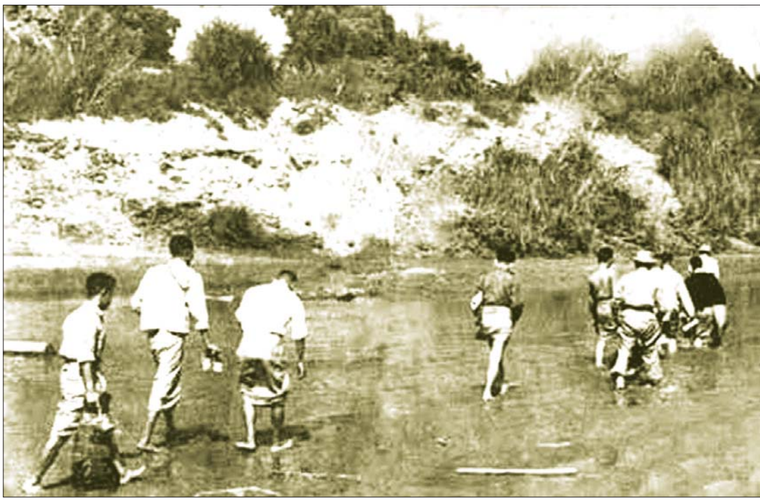
၁၉၆၃ ခုနှစ် ပြည်တွင်းငြိမ်းချမ်းရေးဆွေးနွေးပွဲပျက်ပြားပြီးနောက် ဗမာပြည်ကွန်မြူနစ်ပါတီကိုယ်စားလှယ်များ နဝင်းချောင်းကိုဖြတ်၍ တောပြန်ခိုကြပုံကို “သူတို့ ပြန်ကြလေပြီ” ခေါင်းစဉ်ဖြင့် ရှုဒေါင့်ဂျာနယ်တွင် ဖော်ပြခဲ့သည့် ဓာတ်ပုံ။

သို့ရာတွင် ထိုတစ်ရက်တည်းမှာပင် ဗန္ဓုလပန်းခြံ၌ ကျင်းပသည့် တော်လှန်ရေးနေ့အခမ်းအနားတွင် သခင်သန်းထွန်းက ဖဆပလအစိုးရကို လက်နက်နှင့် ဖြုတ်ချရမည်၊ ဗားကရာချောက်ကြီးကို ဖဆပလအစိုးရနှင့်ဖွဲ့ပစ်မည် စသဖြင့် ဖဆပလအစိုးရကို ခြိမ်းခြောက်စိန်ခေါ်ခဲ့လေသည်။