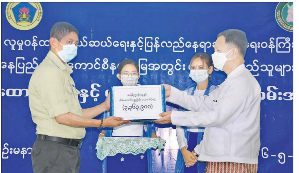
နေပြည်တော်ကောင်စီဥက္ကဋ္ဌ ဒေါက်တာမောင်မောင်နိုင် လေဘေးသင့်ပြည်သူများအတွက် ထောက်ပံ့ငွေပေးအပ်စဉ်။

နေပြည်တော် မေ ၁၁ ပြည်ထောင်စုနယ်မြေ နေပြည်တော်အတွင်းရှိ ပျဉ်းမနားမြို့နယ်နှင့် လယ်ဝေးမြို့နယ်တို့တွင် မေ ၁ ရက်နှင့် ၃ ရက်က လေပြင်းတိုက်ခတ်မှုကြောင့် ပျက်စီးခဲ့သည့် နေအိမ်များနှင့် ဘာသာရေးအဆောက်အအုံနှစ်လုံးတို့အတွက် ထောက်ပံ့ငွေ၊ ရိက္ခာနှင့် ကယ်ဆယ်ရေးပစ္စည်း ၁၇ မျိုးတို့ကို လူမှုဝန်ထမ်း၊ ကယ်ဆယ်ရေးနှင့် ပြန်လည်နေရာချထားရေးဝန်ကြီးဌာနက ထောက်ပံ့ပေးအပ်ခဲ့သည်။