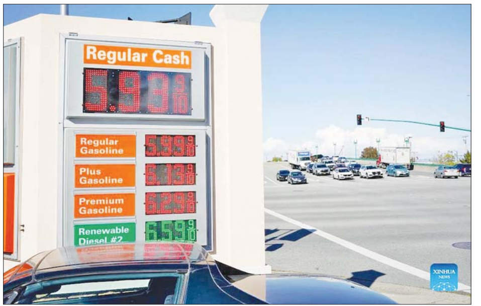
အမေရိကန်ပြည်ထောင်စုရှိ လောင်စာဆီ ရောင်းချနေသည့် ဆိုင်တစ်ဆိုင်တွင် သတ်မှတ်ဈေးနှုန်းများ ဖော်ပြထားမှုကို တွေ့ရစဉ်။