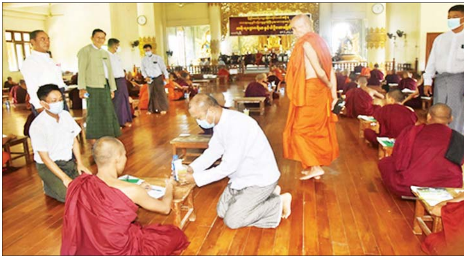
သန္ဓေပင်ကျေးရွာရှိ သိက္ခိဦးပရိယတ္တိစာသင်တိုက်၊ ဧရာဝတီတိုင်းဒေသကြီး အိမ်မဲမြို့ အိမ်မဲမင်းကျောင်းတိုက်၊ မကွေးတိုင်းဒေသကြီး မကွေးမြို့ရှိ ကျောင်းတိုက်တို့သို့ ဆွမ်းဆန်တော်၊ ဆီ၊ ဆား၊ ပဲ အမယ်လေးမျိုး၊ နေဆွမ်းများနှင့် နဝကမ္မအလှူငွေများ ဆက်ကပ်လှူဒါန်းကြပြီးနောက် အစားအသောက်များကို ဆက်လက်လှူဒါန်းခဲ့ကြောင်း သိရသည်။

နေပြည်တော် မေ ၁၁ တပ်မတော်(ကြည်း၊ ရေ၊ လေ) အရာရှိ၊ စစ်သည်၊ အရာထမ်း၊ အမှုထမ်းများနှင့် စေတနာရှင်အလှူရှင်များက မြို့နယ်အသီးသီးရှိ ဘုန်းတော်ကြီးကျောင်းများ၊ သာသနာ့နွယ်ဝင် သီလရှင်ကျောင်းများနှင့် ဘာသာရေးကျောင်းများသို့ ဆွမ်းဆန်တော်၊ ဆီ၊ ဆား၊ ပဲ အမယ်လေးမျိုးနှင့် လှူဖွယ်ပစ္စည်းများ လှူဒါန်းခြင်း၊ နေဆွမ်းများ ဆက်ကပ်လှူဒါန်းခြင်းနှင့် ကျန်းမာရေးစစ်ဆေးပေးခြင်းများကို ဆောင်ရွက်လျက်ရှိသည်။ ထိုသို့ဆောင်ရွက်လျက်ရှိရာ ယနေ့တွင် ရှမ်းပြည်နယ်(အရှေ့ပိုင်း)မိုင်းဆတ်မြို့ရှိ အောင်မင်္ဂလာတပ်ဦးဘုန်းကြီးကျောင်း၊ ဇေယျသုဘုန်းကြီးကျောင်း၊ ပါဘောဘုန်းကြီးကျောင်း၊ ရန်ကုန်တိုင်းဒေသကြီး မင်္ဂလာဒုံမြို့နယ်၊ အမှတ်(၂/က) စံပြရပ်ကွက်ရှိ စက္ကဝဠာကျောင်းတိုက်၊ မှော်ဘီမြို့နယ်