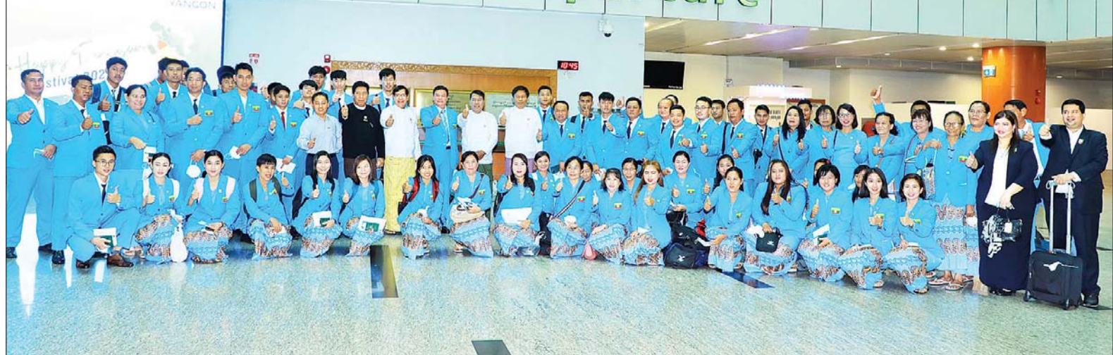
ဝိယက်နမ်နိုင်ငံတွင် ကျင်းပမည့် (၃၁)ကြိမ်မြောက် အရှေ့တောင်အာရှ အားကစားပြိုင်ပွဲတွင် ပါဝင်ယှဉ်ပြိုင်မည့် မြန်မာအားကစားအဖွဲ့အား ရန်ကုန်အပြည်ပြည်ဆိုင်ရာ လေဆိပ်၌ တွေ့ရစဉ်။