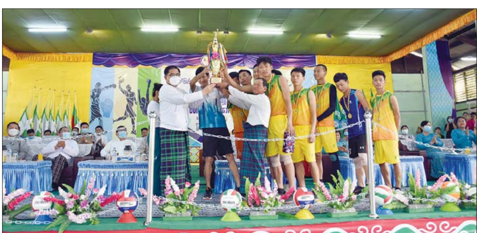
ကချင်ပြည်နယ် ဝန်ကြီးချုပ် ဦးခက်ထိန်နန် ဝန်ကြီးချုပ်ဖလားဖိတ်ခေါ်ဘော်လီဘောပြိုင်ပွဲ ဆုချီးမြှင့်ပွဲအား တံခွန်စိုက်ခိုင်းဆုချီးမြှင့်စဉ်။

မြစ်ကြီးနား မေ ၁၀ မြောက်ပိုင်းတိုင်း စစ်ဌာနချုပ် ၂၀၂၂ ခုနှစ် တိုင်းမှူးခိုင်း ဘောလုံး ပြိုင်ပွဲ ဖွင့်ပွဲအခမ်းအနားကို မေ ၉ ရက်တွင် မြစ်ကြီးနားမြို့ နယ်မြေခံ တပ်အားကစားကွင်း၌ ကျင်းပ သည်။ အခမ်းအနားတွင် မြောက်ပိုင်း တိုင်းစစ်ဌာနချုပ် တိုင်းမှူး ဗိုလ်ချုပ်မြတ်သက်ဦးက အမှာ စကား ပြောကြားသည်။ ယင်း နောက် ပြည်နယ်ဝန်ကြီးချုပ် ဦးခက်ထိန်နန်၊ ပြည်နယ်တရား လွှတ်တော် တရားသူကြီးချုပ်၊ တပ်မတော် အရာရှိကြီးများ၊ ပြည်နယ်ဝန်ကြီးများ၊ တိုင်း စစ်ဌာနချုပ်မှ အရာရှိ၊ စစ်သည် မိသားစုဝင်များနှင့်အတူ အဖွင့် ပွဲစဉ်အဖြစ် မြစ်ကြီးနားတပ်နယ် အသင်း (က) နှင့် (ဇ)အသင်းတို့၏ ယှဉ်ပြိုင်ကစားမှုကို ကြည့်ရှု အားပေးခဲ့သည်။ အဆိုပါ မြောက်ပိုင်းတိုင်း စစ်ဌာနချုပ် ၂၀၂၂ ခုနှစ် တိုင်းမှူး ခိုင်းဘောလုံးပြိုင်ပွဲကို တိုင်း