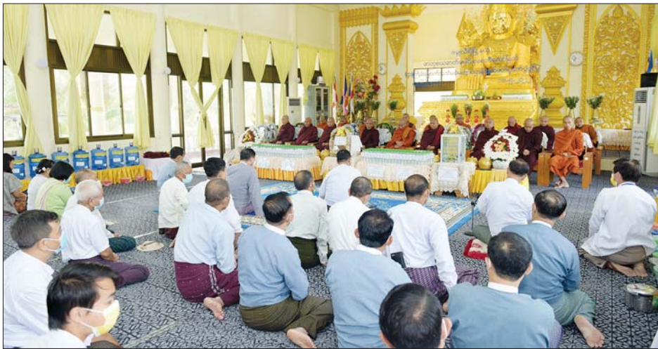
ရုပ်သိမ်းပြီး အလှည့်ကျပဋ္ဌာန်း စတင်ရွတ်ဖတ်ပူဇော်ကာ ပဋ္ဌာန်း ရွတ်ဖတ်ပူဇော်သွားမည် ဖြစ် ဘာဏကသံဃာတော်မှ မဟာ ပူဇော်ပွဲကို ၂၀၂၂ ခုနှစ် မေ ၁၄ ပဋ္ဌာန်း ဒေသနာတော်ကြီးအား ရက်အထိ ငါးရက်တိုင်တိုင် သတင်းစဉ်

များက ငါးပါးသီလခံယူ ဆောက်တည်ကြပြီး တာဝန်ရှိသူ များက ဆရာတော်သံဃာတော် အရှင်သူမြတ်များထံ ပဋ္ဌာန်းကျမ်း စာအုပ်၊ ပဋ္ဌာန်းအိုးနှင့် လှူဖွယ် ဝတ္ထုပစ္စည်းများ ဆက်ကပ် လှူဒါန်းကြသည်။ ဆက်လက်၍ ဆရာတော် ဘဒ္ဒန္တစန္ဒိမာမထေရ်မြတ်ထံမှ ဒုတိယမြို့တော်ဝန် အမျိုးပြု သော ဧည့်ပရိသတ်များက လှူဒါန်းမှု အစုစုတို့အတွက် သာဓုအနုမောဒနာ တရားနာ ကြား၍ အခမ်းအနားကို ဗုဒ္ဓသာ သနံစိရိတိဋ္ဌတု သုံးကြိမ်ရွတ်ဆို ဘုရားကန်တော့ကာ အခမ်းအနား