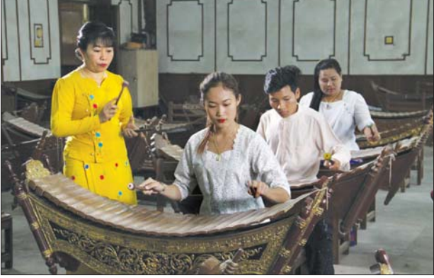
ဂီတပညာဌာနသင်ကြားလေ့ကျင့်မှု။