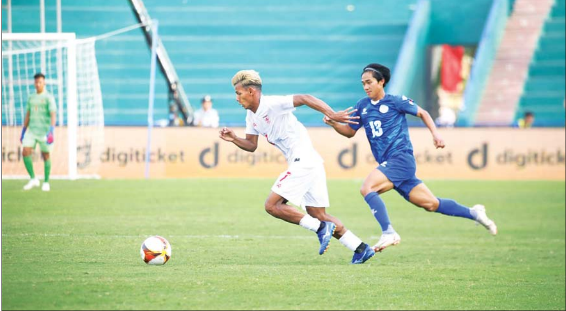
မြန်မာနှင့် ဖိလစ်ပိုင်အသင်း ယှဉ်ပြိုင်နေစဉ်။