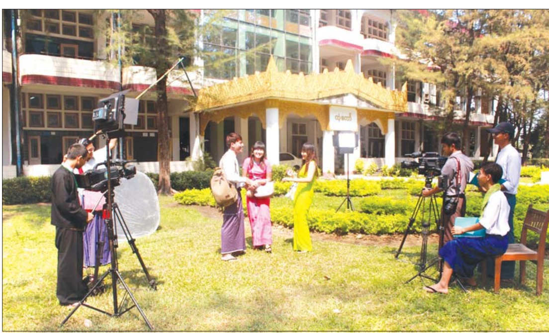
ရုပ်ရှင်နှင့်ပြဇာတ်ပညာသင်ယူလေ့ကျင့်မှုရိုက်ကွင်း။

စာမျက်နှာ ၁၀ မှ ဗီဒီယိုကို ရွေးချယ်လက်ခံသည်။ ဝင်ခွင့် အရည်အချင်းစစ်စစ်မေးပွဲနှင့် လူတွေ စစ်ဆေးမှုကို ခံယူရမည်ဖြစ်သည်။ ကျောင်းတက်ရောက်ခွင့်ရရှိလိုလျှင် ပထမနှစ်ဝက်ကို နိုဝင်ဘာ ၁ ရက်မှ မတ် ၃၀ ရက်အထိ တက်ရောက်ပြီး ဧပြီ တွင် ကျောင်းတစ်လပတ်ကာ ဒုတိယ နှစ်ဝက်ကို မေ ၁ ရက်မှ စက်တင်ဘာ ၃၀ ရက်အထိ တက်ရောက်ကြရမည် ဖြစ်သည်။ အောက်တိုဘာတစ်လ ကျောင်းပိတ်သည်။ မတ်နှင့် စက်တင် ဘာတို့တွင် ပထမနှစ်ဝက်နှင့် ဒုတိယ နှစ်ဝက်စာမေးပွဲများကို စာတွေ့နှင့် လက်တွေ့နှစ်မျိုး ဖြေဆိုကြရမည်ဖြစ် ပါသည်။