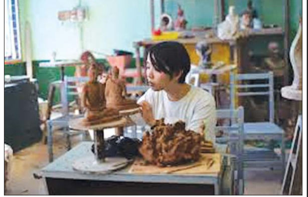
ပန်းပုပညာသင်ယူလေ့ကျင့်မှု။