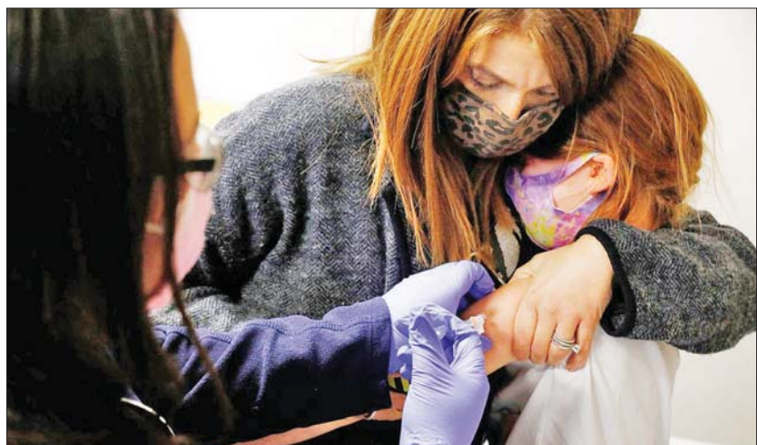
အမေရိကန်ပြည်ထောင်စု မီချီဂန်တွင် အသက်ခြောက်နှစ်အရွယ်ကလေးငယ်ကို ဖိုက်ဇာ-ဘီအွန်တက်ခံ ကိုဗစ်-၁၉ ကာကွယ်ဆေးထိုးပေးနေမှုကို မိခင်က နှစ်သိမ့်အားပေးနေသည်ကို တွေ့ရစဉ်။