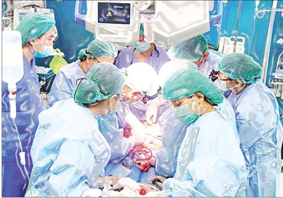
ရန်ကုန်ဆေးရုံကြီး၌ ကလေးလူနာတစ်ဦးအား ကျောက်ကပ်အစားထိုးကုသပေးနေသည့် ကျန်းမာရေးဝန်ထမ်းများ။

ဖလော့ရင့်နိုက်တင်ဂေးလ်ဟာ ၁၈၅၄ ခုနှစ်မှာ ဖြစ်ပွားခဲ့တဲ့ ခရိုင်မီယန် စစ်ပွဲအတွင်းမှာ လူနာတွေကို ပြုစုကုသမှုပေးခဲ့တဲ့ မီးအိမ်ရှင်မ “The Lady with the lamp” အဖြစ် ထင်ရှားခဲ့ပါတယ်။ စစ်မြေပြင်မှာ ထိခိုက်ဒဏ်ရာရတဲ့ စစ်သည်လူနာတွေကို နေ့မအား၊ ညမနား မှောင်မည်းနေတဲ့ စစ်မြေပြင်မှာ လက်ထဲမှာမီးအိမ်လေးဆွဲပြီး လိုက်လံရှာဖွေ ပြုစုကုသပေးခဲ့လို့ ဒဏ်ရာရစစ်သည်တွေက စတင်ပြီး ပေးခဲ့ကြတဲ့နာမည်လေးပါ။ သူဦးဆောင်ပြီး စစ်မြေပြင်မှာ အိမ်လို ကူညီခဲ့တာဟာ စစ်မြေပြင်ဒဏ်ရာရ စစ်သည်တွေရဲ့ သေဆုံးမှုကို ၄၀ ရာခိုင်နှုန်းမှ ၂ ရာခိုင်နှုန်းသို့ လျော့ချပေးနိုင်ခဲ့ပါတယ်။