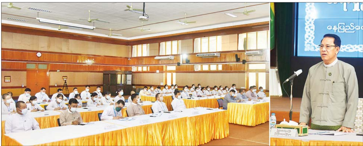
ပြည်ထောင်စုဝန်ကြီး ဦးမောင်မောင်အုန်း ပြန်ကြားရေးဝန်ကြီးဌာန ပြန်ကြားရေးနှင့် ပြည်သူ့ဆက်ဆံရေးဦးစီးဌာနအရာရှိ စွမ်းရည်မြှင့်တင်တန်း (၁/၂၀၂၂) ဖွင့်ပွဲအခမ်းအနားတွင် အမှာစကားပြောကြားစဉ်။

သင်တန်းဖွင့်ပွဲတွင် ပြန်ကြားရေးဝန်ကြီးဌာန ပြည်ထောင်စုဝန်ကြီး ဦးမောင်မောင်အုန်း က အမှာစကား ပြောကြားရာ၌ ပြန်ကြားရေးနှင့် ပြည်သူ့ဆက်ဆံရေးဦးစီးဌာနအနေဖြင့် ပြီးခဲ့သည့် ၂၀၂၁ ခုနှစ် တစ်နှစ်တာနှင့် ၂၀၂၂ ခုနှစ် ဇန်နဝါရီလမှ မတ်လအထိ ဝန်ထမ်းများ၏ လုပ်ငန်းစွမ်းဆောင်ရည် မြှင့်တင်ရေးအတွက် သင်တန်းပေါင်း ၂၂ ကြိမ် ဖွင့်လှစ်