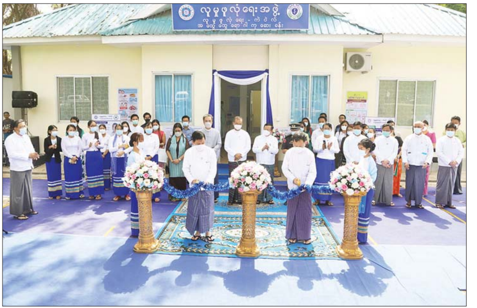
ပြည်ထောင်စုဝန်ကြီး ဦးမြင့်ကြိုင်နှင့် နေပြည်တော်ကောင်စီဥက္ကဋ္ဌ ဒေါက်တာ မောင်မောင်နိုင်တို့က လူမှုဖူလုံရေး-ကဲဝဲလ် အထွေထွေရောဂါကုဆေးခန်း (ဘောဂသိဒ္ဓိ-၁)ကို ဖဲကြိုးဖြတ်ဖွင့်လှစ်ပေးစဉ်။

လူမှုဖူလုံရေးအဖွဲ့၌ တစ်နိုင်ငံလုံးတွင် အကျိုးဝင်သော အလုပ်သမားပေါင်း ၃၃၈၆၈ ဌာနနှင့် အာမခံအလုပ်သမားပေါင်း ၁၁၀၇၃၃၈ ဦးရှိပြီး နေပြည်တော်ကောင်စီနယ်မြေတွင် အကျိုးဝင် အလုပ်သမားပေါင်း ၉၉၂ ဌာနနှင့် အကျိုးဝင်အာမခံအလုပ်သမားပေါင်း ၂၄၃၆၀ ရှိကြောင်း၊ နေပြည်တော်ကောင်စီနယ်မြေအတွင်းရှိ အာမခံအလုပ်သမားများကို ဆေးကုသဝန်ဆောင်မှုပေးနိုင်ရေးအတွက် မြို့နယ်လူမှုဖူလုံရေးဆေးခန်း သုံးခန်း၊ ဌာနကြီးဆေးခန်း လေးခန်းနှင့် စာချုပ်ဆေးခန်းနှစ်ခန်းတို့ဖြင့် ဆေးကုသမှုဝန်ဆောင်မှုလုပ်ငန်းများကို ဆောင်ရွက်ပေးလျက်ရှိကြောင်း၊ နေပြည်တော်ကောင်စီနယ်မြေအတွင်းရှိသော လူမှုဖူလုံရေးအကျိုးဝင် အာမခံအလုပ်သမားများအတွက် ကျန်းမာရေးစောင့်ရှောက်မှုများကို အလွယ်တကူရယူအသုံးပြုနိုင်စေရန် ရည်ရွယ်ပြီး ဧမ္မာသီရိမြို့နယ် ဘောဂသိဒ္ဓိရပ်ကွက်တွင် လူမှုဖူလုံရေး-ကဲဝဲလ် အထွေထွေရောဂါကုဆေးခန်း တစ်ခန်းကို တိုးချဲ့ဖွင့်လှစ်ရခြင်းဖြစ်ကြောင်း၊ လူမှုဖူလုံရေး-ကဲဝဲလ် ဆေးခန်း (ဘောဂသိဒ္ဓိ-၁)သည် နေပြည်တော်ကောင်စီနယ်မြေအတွက် သုံးခန်းမြောက် စာချုပ်ဆေးခန်းဖြစ်ပြီး နေပြည်တော်ကောင်စီနယ်မြေအကျိုးဝင်အာမခံအလုပ်သမားများ ဝန်ဆောင်မှုရယူနိုင်သည့် ဆေးခန်း ၁၀ ခန်း ရှိပြီးဖြစ်ကြောင်း၊ လူမှုဖူလုံရေး-ကဲဝဲလ်ဆေးခန်းများတွင် အထွေထွေရောဂါကုသမှု (OPD Care) သာမက သားဖွား/မီးယပ် ပြင်ပလူနာကုသမှု (Specialist OG OPD Care) ဝန်ဆောင်မှု ဆောင်ရွက်ပေးသွားမည်ဖြစ်ပြီး တနင်္လာနေ့မှ စနေနေ့အတွင်း နံနက် ၈ နာရီမှ ည ၈ နာရီအထိ ဖွင့်လှစ်ကုသ ပေးသွားမည်ဖြစ်ကြောင်း၊ ဆက်လက်၍ စာချုပ်ဆေးခန်းများ ထပ်မံတိုးချဲ့