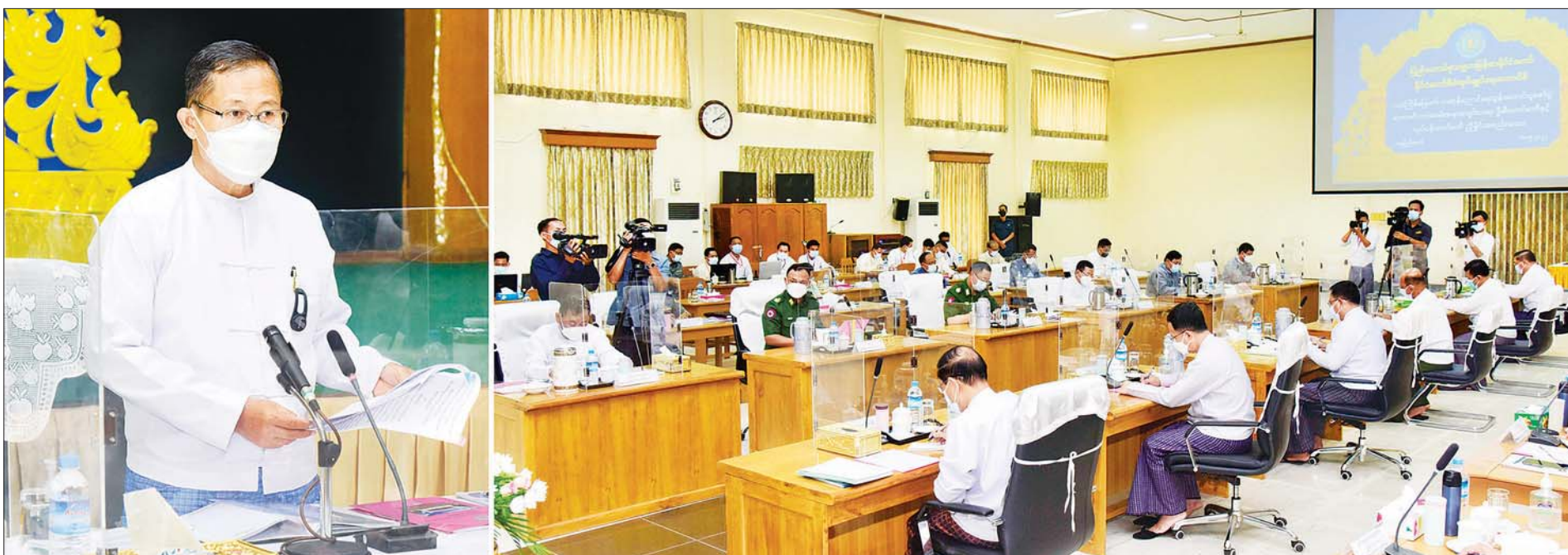
နိုင်ငံတော်စီမံအုပ်ချုပ်ရေးကောင်စီ ဒုတိယဥက္ကဋ္ဌ ဒုတိယဝန်ကြီးချုပ် ဒုတိယဗိုလ်ချုပ်မှူးကြီး စိုးဝင်း (၁၄) ကြိမ်မြောက် ကဆုန်ညောင်ရေသွန်းလောင်းပူဇော်ပွဲ မဟာမင်္ဂလာအခမ်းအနားကျင်းပရေးဦးစီးကော်မတီနှင့် လုပ်ငန်းကော်မတီ ညှိနှိုင်းအစည်းအဝေးတွင် အမှာစကားပြောကြားစဉ်။

၄။ တစ်နိုင်ငံလုံး ထာဝရငြိမ်းချမ်းရေးရရှိရေးအတွက် တစ်နိုင်ငံလုံး ပစ်ခတ်တိုက်ခိုက်မှုရပ်စဲရေး သဘောတူစာချုပ် (NCA) ပါ သဘောတူညီချက်များအတိုင်း ဖြစ်နိုင်သမျှ အလေးထား လုပ်ဆောင်သွားမည်။ ၅။ အရေးပေါ်ကာလဆိုင်ရာ ပြဋ္ဌာန်းချက်များနှင့်အညီ ဆောင်ရွက်ပြီးစီးပါက ဖွဲ့စည်းပုံအခြေခံဥပဒေ (၂၀၀၈ ခုနှစ်)နှင့်အညီ လွတ်လပ်ပြီး တရားမျှတသော ပါတီစုံဒီမိုကရေစီ အထွေထွေရွေးကောက်ပွဲအား ပြန်လည်ကျင်းပ၍ အနိုင်ရသည့်ပါတီအား ဒီမိုကရေစီစံနှုန်းများနှင့်အညီ နိုင်ငံတော်တာဝန်အား လွှဲအပ်နိုင်ရေး ဆက်လက်ဆောင်ရွက်သွားမည်။