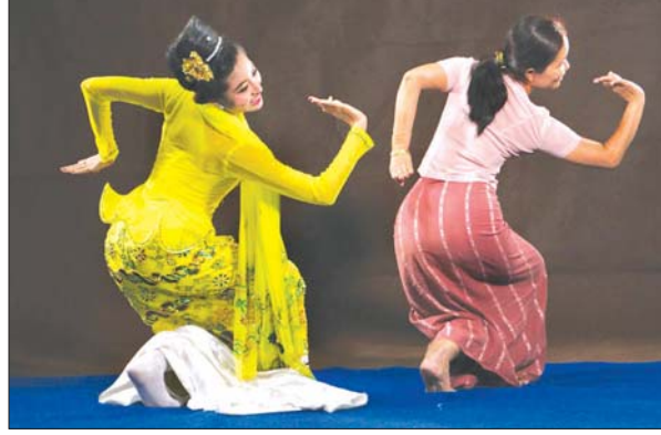
သဘင်ပညာရပ်သင်ယူလေ့ကျင့်မှု။

တက္ကသိုလ်ဝင်ခွင့်အရည်အချင်းမှာ ၁၀ တန်းအောင်ဟု သတ်မှတ်သည်။ သိပ္ပံတွဲ၊ ဝိဇ္ဇာတွဲ၊ အမှတ်အနည်းအများ မခွဲခြားဘဲ အနုပညာဝါသနာပါခြင်းနှင့် အနုပညာ စာမျက်နှာ ၁၁ သို့