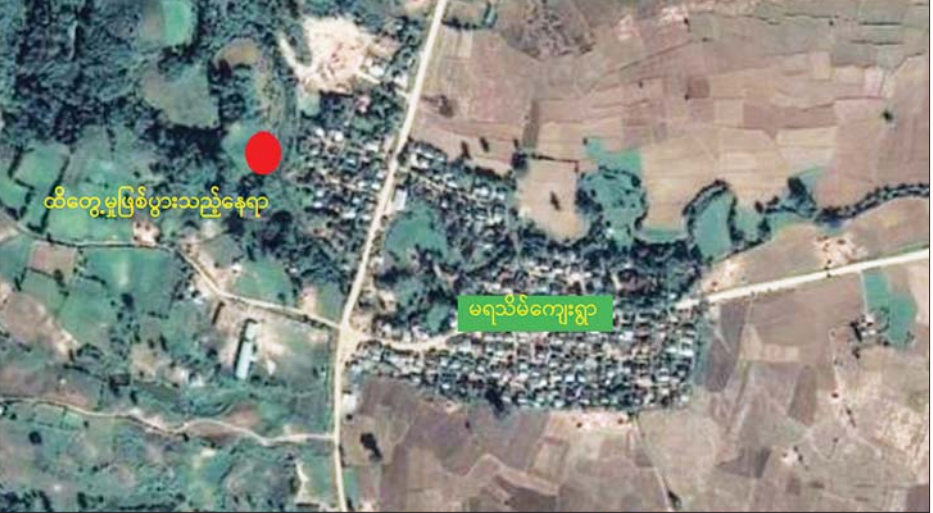
ထီးချိုင့်မြို့နယ် မရသိမ်းကျေးရွာအနီး၌ အဖျက်အမှောင့်လုပ်ရပ်များ လုပ်ဆောင်ရန် ရောက်ရှိနေသည့် PDF အမည်ခံအကြမ်းဖက်သမားများနှင့် ထိတွေ့မှုဖြစ်စဉ် ဖြစ်ပွားမှု နေရာပြပုံ။

အကြမ်းဖက်သမားများအနေ ဖြင့် ကျေးရွာအချို့အတွင်း ဝင်ရောက်၍ အကြမ်းဖက် လုပ်ရပ်များ လုပ်ဆောင်လျက်ရှိ ခြင်းကြောင့် ဒေသပြည်သူများ အေးချမ်းတည်ငြိမ်စွာ နေထိုင်နိုင် ရေးအတွက် လုံခြုံရေးတပ်ဖွဲ့များ က နယ်မြေလုံခြုံရေးလုပ်ငန်းများ