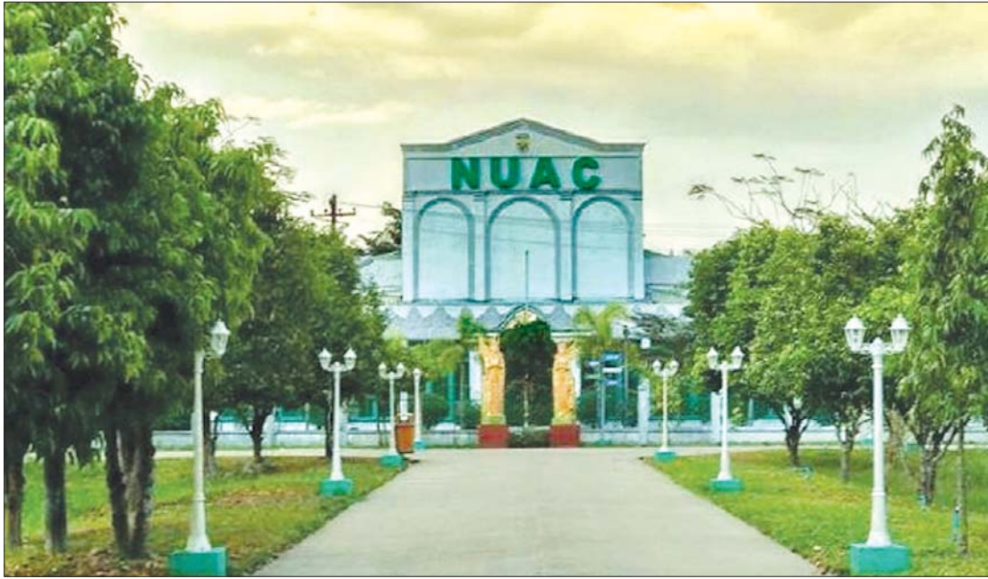
အမျိုးသားယဉ်ကျေးမှုနှင့် အနုပညာတက္ကသိုလ်(ရန်ကုန်)။

အနုပညာကို သင်ကြားခြင်း အနုပညာကိုသင်ကြား၍ ရ၏၊ မရ၏ ဆိုခြင်းကို အနုပညာရှင်များက အဖြေအမျိုးမျိုးပေးခဲ့ကြပြီးဖြစ်သည်။ အချို့က သင်ကြား၍ ရနိုင်သည်ဟုဆို၏။ အချို့က သင်ကြား၍ မရနိုင်ဟုဆို၏။ မည်သို့ဆိုစေ နိုင်ငံတကာတွင် အနုပညာသင်ကြားရေးဆိုင်ရာ သင်တန်းကျောင်းများ၊