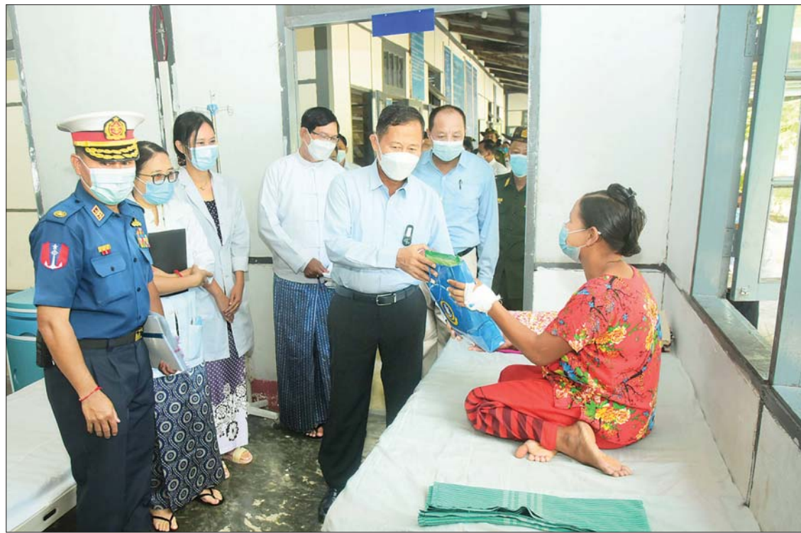
နိုင်ငံတော်စီမံအုပ်ချုပ်ရေးကောင်စီ ဒုတိယဥက္ကဋ္ဌ ဒုတိယတပ်မတော်ကာကွယ်ရေးဦးစီးချုပ် ကာကွယ်ရေးဦးစီးချုပ် (ကြည်း) ဒုတိယဗိုလ်ချုပ်မှူးကြီး စိုးဝင်း ကိုကိုးကျွန်းမြို့ရှိ မြို့နယ်ပြည်သူ့ဆေးရုံတွင် တက်ရောက်ဆေးကုသမှုခံယူလျက်ရှိသည့် ဒေသခံပြည်သူတစ်ဦးအား စားသောက်ဖွယ်ရာများနှင့် ထောက်ပံ့ပစ္စည်းများ ပေးအပ်စဉ်။