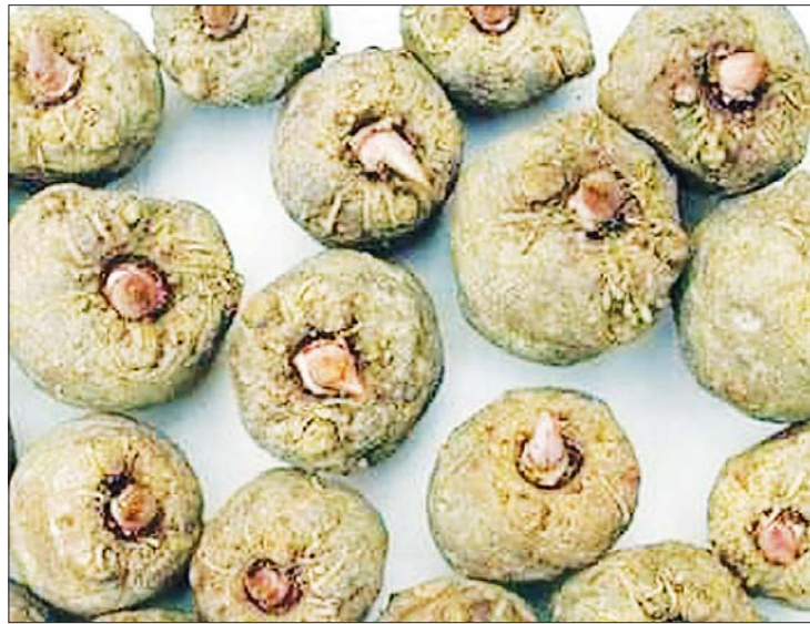
ဝဉ္စရွက်သီးနှင့် ဝဉ္စများ။

၃၅ ဒီဂရီစင်တီဂရိတ်၊ ပင်လယ်ရေ မျက်နှာပြင်အထက် ပေ ၁၀၀၀ နှင့် ၅၀၀၀ ကြား စိုက်ပျိုးနိုင်သည်။ ပင်လယ် ရေမျက်နှာပြင် ပေ ၂၅၀၀ နှင့် အထက် စိုက်ပျိုးပါက အရိပ်မလိုပေ။ ပေ ၁၀၀၀ အောက် စိုက်ပျိုးပါက ၆၀ ရာခိုင်နှုန်းမှ ၇၀ ရာခိုင်နှုန်းကြား အရိပ်ရရန်လိုအပ် ပေသည်။