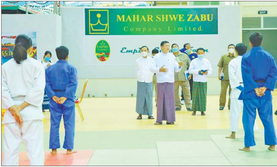
အရှေ့တောင်အာရှအားကစားပြိုင်ပွဲ ဝင်ရောက်ယှဉ်ပြိုင်ရန် လေ့ကျင့်နေသည့် မြန်မာ့လက်ရွေးစင်ဂျပူအားကစားသမားများအား ပြည်ထောင်စုဝန်ကြီး ဦးမင်းသိန်းဇံ မတ်လအတွင်းက တွေ့ဆုံအားပေးစဉ်။

ပြိုင်ပွဲအတွက် ကြိုတင်ပြင်ဆင် လေ့ကျင့်နေစဉ် ကာလအတွင်းတွင် အားကစားဌာနမှ အားကစားနည်းအလိုက် လေ့ကျင့်မှုကြပ်မတ်စစ်ဆေးရေးအဖွဲ့များ ဖွဲ့စည်းဆောင်ရွက်ခဲ့ကြပြီး ဌာနအကြီးအကဲများဖြစ်သည့် ပြည်ထောင်စုဝန်ကြီး၊ ဒုတိယဝန်ကြီး၊ ညွှန်ကြားရေးမှူးချုပ်၊ ဒုတိယညွှန်ကြားရေးမှူးချုပ်များအပါအဝင် မြန်မာနိုင်ငံအားကစားအဖွဲ့ချုပ်များမှ အဖွဲ့ချုပ်ဥက္ကဋ္ဌများ၊