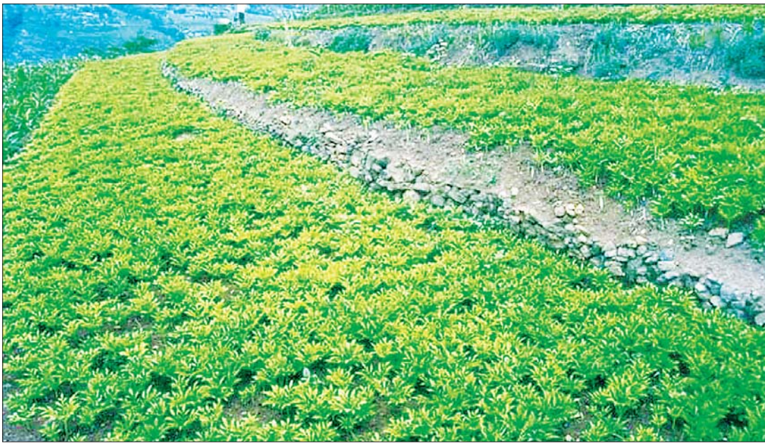
တောင်ပေါ်ဒေသရှိ ဝဉ္စစိုက်ခင်းတစ်ခင်း။

ကမ္ဘာပေါ်တွင် ဝဉ္စ မျိုးစိတ်ပေါင်း ၈၀ ခန့်ရှိပြီး ဝဉ္စကို လွန်ခဲ့သည့် နှစ်ပေါင်း များစွာကပင် ဂျပန်နိုင်ငံ၌ ဆေးဝါးအဖြစ် သုံးစွဲကြသည်။ ဝဉ္စသည် သဘာဝမြေ အောက်ရှိ သတ္တုဓာတ်များ ပါဝင်သော ရေ ၉၀ ရာခိုင်နှုန်း စုပ်ယူထားသော ကြောင့် ကိုယ်လက်ကျန်းမာ ကြံ့ခိုင်စေ သည်။ ပိန်းရိုင်းပင်များကဲ့သို့ပင် လျှာ ယားစေသည့် Oxalic acid ပါဝင်သည့် အတွက် အစိမ်းစား၍ မသင့်ပေ။ ကုန်ချော ပစ္စည်းအဖြစ် အသွင်ပြောင်း၍ မုန့်မျိုးစုံ၊ အချိုရည်၊ စားသောက်ကုန်၊ အလှကုန်၊ စက်မှုကုန်ကြမ်း၊ တိုင်းရင်းဆေးဝါးနှင့် ခေတ်မီ ဆေးဝါးများစွာ ထုတ်လုပ်လျက် ရှိသည်။