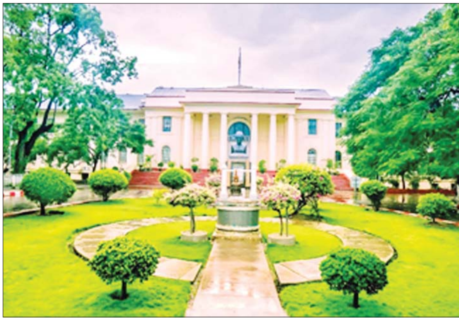
၂၀၂၅ ခုနှစ်တွင် နှစ်ပေါင်း ၁၀၀ ပြည့်မည့် မန္တလေးတက္ကသိုလ်။

၁၈၄၀ ပြည့်နှစ်ရောက်တော့ စက်မှုထွန်းကားဖို့ ကိစ္စမှာ သိပ္ပံပညာအခြေခံတွေဟာ အကြောင်းတရား ပဲ ဖြစ်ခဲ့ပါတယ်။ တရိပ်ရိပ်စက်မှုထွန်းကားလာတဲ့ ဥရောပနဲ့ အမေရိကန်နိုင်ငံဟာ စက်ရုံအလုပ်ရုံ များမှာ ကုန်ပစ္စည်းမျိုးစုံကို ထုတ်လုပ်ပြီး ကမ္ဘာ့ဈေး ကွက်ကို ထိုးဖောက်ခဲ့ပါတယ်။ ဈေးကလည်း သက်သာ၊ ပစ္စည်းတွေကလည်း သေသပ်လှပပြီး လူကြိုက်များခဲ့ပါတယ်။ စက်မှုနည်းပညာ ထွန်းကား ခြင်းရဲ့ရလဒ်ပဲ။ သိပ္ပံနည်းပညာ ထွန်းကားတဲ့ နိုင်ငံတွေဟာ ပိုပြီးချမ်းသာသွားကြပါတယ်။ အမေရိကန်တစ်ဦးဟာ ပျမ်းမျှတစ်ပတ် ၅၅ နာရီ အလုပ် လုပ်ကြရပါတယ်။ နည်းပညာတိုးတက် လာတာကြောင့် ယနေ့အမေရိကန်တို့ဟာ ၃၇ ဒသမ ၉ နာရီသာ အလုပ်လုပ်ကြရပါတော့တယ်။ အမေရိကန်တို့ဟာ ၁၈၉၀ ပြည့်နှစ်မှာ စက်မှု လယ်ယာကို တည်ထောင်နိုင်ခဲ့ပြီဖြစ်ပါတယ်။