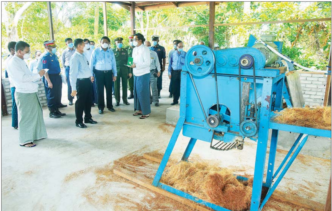
နိုင်ငံတော်စီမံအုပ်ချုပ်ရေးကောင်စီ ဒုတိယဥက္ကဋ္ဌ ဒုတိယတပ်မတော်ကာကွယ်ရေးဦးစီးချုပ် ကာကွယ်ရေးဦးစီးချုပ် (ကြည်း) ဒုတိယဗိုလ်ချုပ်မှူးကြီး စိုးဝင်း ကိုကိုးကျွန်းမြို့ရှိ အောင်နိုင်သူ အုန်းဆံကြီးထုတ်လုပ်မှုလုပ်ငန်းအား ကြည့်ရှုစဉ်။

ရေးအတွက် အားလုံးပူးပေါင်း၍ ဝိုင်းဝန်း ချုပ် (ကြည်း) က ဒေသဖွံ့ဖြိုးရေးအတွက် လုပ်ဆောင်သွားကြရန် လိုကြောင်း ထောက်ပံ့ငွေများကို လည်းကောင်း၊ ပြောကြားသည်။ တိုင်းဒေသကြီး ဝန်ကြီးချုပ်က ထို့နောက် နိုင်ငံတော်စီမံအုပ်ချုပ်ရေး စားသောက်ဖွယ်ရာများကို လည်းကောင်း ကောင်စီဒုတိယဥက္ကဋ္ဌ ဒုတိယတပ်မတော် ပေးအပ်ရာ တာဝန်ရှိသူများက လက်ခံ ကာကွယ်ရေးဦးစီးချုပ်ကာကွယ်ရေးဦးစီး ရယူကြသည်။