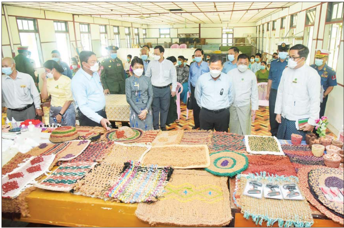
နိုင်ငံတော်စီမံအုပ်ချုပ်ရေးကောင်စီ ဒုတိယဥက္ကဋ္ဌ ဒုတိယတပ်မတော်ကာကွယ်ရေးဦးစီးချုပ် ကာကွယ်ရေးဦးစီးချုပ် (ကြည်း) ဒုတိယဗိုလ်ချုပ်မှူးကြီး စိုးဝင်း ကိုကိုးကျွန်းမြို့ရှိ အခြေခံပညာအထက်တန်းကျောင်း၌ အသေးစားစက်မှုလက်မှုလုပ်ငန်း ဦးစီးဌာနက ဖွင့်လှစ်သင်ကြားပေးနေသည့် စားသောက်ကုန်နှင့် လူသုံးကုန်ထုတ်လုပ်မှု နည်းပညာသင်တန်းတွင် သင်တန်းသား/ သင်တန်းသူများအား သင်ကြားပို့ချနေမှုကို ကြည့်ရှုစဉ်။

ပညာရေးနှင့်ပတ်သက်၍ တိုးတက်လာသော IT ခေတ်တွင် ကျေးလက်နှင့် ဖွံ့ဖြိုးသင်ယူနိုင်သည့် အခြေအနေမှာ များစွာကွာခြားမှုမရှိဘဲ ဆရာ၊ ဆရာမ များ၏ စေတနာ၊ ဝါသနာ၊ အနစ်နာ စသည့် နာသုံးနာဖြင့် သင်ကြားပေးမှု၊ ကျောင်းသား/ကျောင်းသူ များ၏ တတ်မြောက်လိုမှု၊ မိဘနှင့် မြို့နယ် အုပ်ချုပ်ရေးအဖွဲ့တို့၏ အားပေးဆောင်ရွက်မှုဖြင့် အောင်ချက်မြင့်မားလာမည် ဖြစ်ကြောင်း၊ ကျောင်းသား/ကျောင်းသူ များ စိတ်လက်အေးချမ်း တက်ကြွစွာ ကျောင်းတက်နိုင်ရေး ကျောင်းတွင်း/ ကျောင်းပြင် သန့်ရှင်းရေး ဆောင်ရွက်၍ ဥပဓိရုပ်ကောင်းမွန်အောင် ဝိုင်းဝန်း ပြင်ဆင် ဆောင်ရွက်သွားကြရန်လို ကြောင်း၊ ဒေသဖွံ့ဖြိုးရေးနှင့်ပတ်သက်၍ နိုင်ငံတော်ဝန်ကြီးချုပ်အနေဖြင့် ၂၀၁၂ ခုနှစ်မှစတင်၍ အခြေခံအဆောက်အအုံ လိုအပ်ချက်များ စတင်ဖြည့်ဆည်းလာ ခဲ့ကြောင်း၊ ဒေသခံပြည်သူများ သွားလာ ရေးအဆင်ပြေစေရေးအတွက် နှစ်ပတ် တစ်ကြိမ် တပ်မတော်လေယာဉ်ဖြင့် လည်းကောင်း၊ တစ်လ တစ်ကြိမ် တပ်မတော်ရေယာဉ်များဖြင့် လည်း ကောင်း၊ သယ်ယူပို့ဆောင်ပေးလျက်ရှိ ကြောင်း၊ ယခုထက် ပိုမိုဖွံ့ဖြိုးတိုးတက်