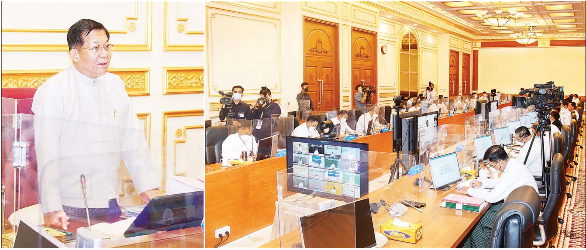
နိုင်ငံတော်စီမံအုပ်ချုပ်ရေးကောင်စီဥက္ကဋ္ဌ နိုင်ငံတော်ဝန်ကြီးချုပ် ဗိုလ်ချုပ်မှူးကြီး မင်းအောင်လှိုင် ပြည်ထောင်စုအစိုးရအဖွဲ့အစည်းအဝေး အမှတ်စဉ် (၃/၂၀၂၂)တွင် အမှာစကားပြောကြားစဉ်။

နေပြည်တော် မေ ၅ ပြည်ထောင်စုအစိုးရအဖွဲ့ အစည်းအဝေး အမှတ်စဉ် (၃/၂၀၂၂) ကို ယနေ့နံနက်ပိုင်းတွင် နေပြည်တော်ရှိ နိုင်ငံတော်စီမံအုပ်ချုပ်ရေးကောင်စီဥက္ကဋ္ဌရုံး အစည်းအဝေးခန်းမ၌ ကျင်းပရာ နိုင်ငံတော်စီမံအုပ်ချုပ်ရေးကောင်စီဥက္ကဋ္ဌ နိုင်ငံတော်ဝန်ကြီးချုပ် ဗိုလ်ချုပ်မှူးကြီး မင်းအောင်လှိုင် တက်ရောက်အမှာစကားပြောကြားသည်။ အစည်းအဝေးသို့ ပြည်ထောင်စုအစိုးရအဖွဲ့ဝင် ပြည်ထောင်စုဝန်ကြီးများ တက်ရောက်ကြပြီး နေပြည်တော်ကောင်စီဥက္ကဋ္ဌ၊ တိုင်းဒေသကြီးနှင့် ပြည်နယ်ဝန်ကြီးချုပ်များက Video Conferencing ဖြင့် တက်ရောက်ကြသည်။ စာမျက်နှာ ၃ ကော်လံ ၁ *