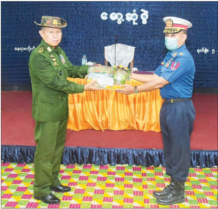
နိုင်ငံတော်စီမံအုပ်ချုပ်ရေးကောင်စီ ဒုတိယဥက္ကဋ္ဌ ဒုတိယတပ်မတော်ကာကွယ်ရေးဦးစီးချုပ် ကာကွယ်ရေးဦးစီးချုပ် (ကြည်း) ဒုတိယဗိုလ်ချုပ်မှူးကြီး စိုးဝင်း ကိုကိုးကျွန်းမြို့နယ်ရှိ အရာရှိ၊ စစ်သည် မိသားစုများအတွက် စားသောက်ဖွယ်ရာပစ္စည်းများ ပေးအပ်စဉ်။

ဦးစွာ နိုင်ငံတော်စီမံအုပ်ချုပ်ရေးကောင်စီဒုတိယဥက္ကဋ္ဌ ဒုတိယတပ်မတော်ကာကွယ်ရေးဦးစီးချုပ် ကာကွယ်ရေးဦးစီးချုပ် (ကြည်း) က အမှာစကားပြောကြားရာတွင် ကိုကိုးကျွန်းမြို့၏ ဖြစ်ပေါ်တိုးတက်မှုကို အားလုံးတွေ့မြင်နိုင်မည်ဖြစ်ကြောင်း၊ သင့်တင့်သော လူစည်ကားမှုနှင့်အတူ ပထဝီနိုင်ငံရေးအရအရေးပါသောမြေနေရာအား တည်ငြိမ်မှုကို မလိုလားသော အကြမ်းဖက်အဖွဲ့အစည်းများ ထိုးဖောက်ဝင်ရောက်လာမှုမရှိအောင် လုံခြုံရေး သတိရှိနေရန်လိုကြောင်း၊ ရေခြားမြေခြားတွင် တာဝန်ထမ်းဆောင်နေကြသူများဖြစ်၍ တပ်တွင်း၌သာမက တပ်ပြင်နှင့်ပါ တစ်သားတည်းစည်းလုံးမှုရှိအောင် နေထိုင်ခြင်းဖြင့် အကြမ်းဖက်အန္တရာယ်ကို ကြိုတင်ကာကွယ်နိုင်မည်ဖြစ်ကြောင်း၊ စည်းလုံးညီညွတ်မှုအတွက် အကောင်းဆုံးအထောက်အကူပြုမှုမှာ အားကစားပြိုင်ပွဲများဖြစ်၍ အစုအဖွဲ့ဖြင့် လူအများအပြားပါဝင်ကစားနိုင်သော အားကစားပွဲများ ဆောင်ရွက်ပေးရန်လိုကြောင်း၊ အဆောက်အဦ ထိန်းသိမ်းမှုနှင့်ပတ်သက်၍ စစ်သည်မိသားစုများအတွက် လိုအပ်သော အခြေခံအဆောက်အဦများ နိုင်ငံတော်ဘတ်ဂျက်မှ ဆောင်ရွက်ပေးထားပြီးဖြစ်၍ ရေရှည်တည်တံ့ ခိုင်မြဲရေး စနစ်တကျ ထိန်းသိမ်း သုံးစွဲကြရန်လိုကြောင်း၊ လေ့ကျင့်ရေးနှင့်ပတ်သက်၍ တပ်မတော်သားများသည် နိုင်ငံတော်ကာကွယ်ရေးတာဝန်ကို အပြည့်အဝ ထမ်းဆောင်နိုင်ရန်အတွက် အမြဲလေ့ကျင့်နေရန်လိုကြောင်း၊ ၂၄ နာရီ တာဝန်ရှိသူများဖြစ်၍ နေ့ည အချိန်အခါ နေရာဒေသမရွေး လိုအပ်ချိန်တွင် တာဝန်ထမ်းဆောင်နိုင်ရမည်ဖြစ်၍ ပေါ့ပေါ့ဆဆ မနေရန်နှင့် သတ်မှတ်ပေးထားသော လေ့ကျင့်ရေးဆိုင်ရာကိစ္စရပ်များကို အချိန်ကာလအလိုက် ဆောင်ရွက်သွားရန်လိုကြောင်း၊ မိခင်ဌာနချုပ်များနှင့် အလှမ်းဝေးကွာသည့်နေရာတွင် တာဝန်ထမ်းဆောင်နေရသူများဖြစ်၍ ဆောင်ရွက်ရမည့် သမားစဉ်လုပ်ငန်းများကို တာဝန်ရှိသူများ