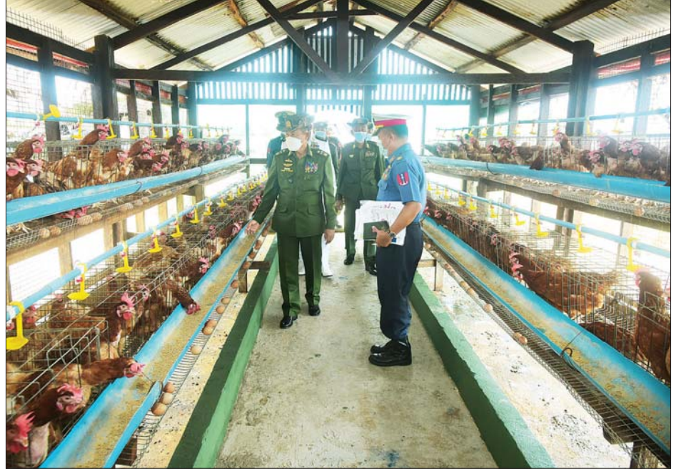
နိုင်ငံတော်စီမံအုပ်ချုပ်ရေးကောင်စီ ဒုတိယဥက္ကဋ္ဌ ဒုတိယတပ်မတော်ကာကွယ်ရေးဦးစီးချုပ် ကာကွယ်ရေးဦးစီးချုပ် (ကြည်း) ဒုတိယဗိုလ်ချုပ်မှူးကြီး စိုးဝင်း ကိုကိုးကျွန်းမြို့ နယ်မြေခံတပ်ရှိ ဥစားကြက်များမွေးမြူထားရှိမှုကို ကြည့်ရှုစစ်ဆေးစဉ်။