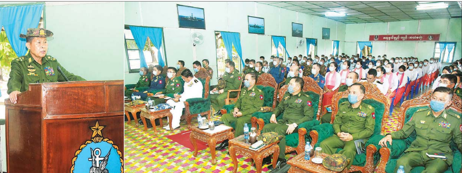
နိုင်ငံတော်စီမံအုပ်ချုပ်ရေးကောင်စီ ဒုတိယဥက္ကဋ္ဌ ဒုတိယတပ်မတော်ကာကွယ်ရေးဦးစီးချုပ် ကာကွယ်ရေးဦးစီးချုပ် (ကြည်း) ဒုတိယဗိုလ်ချုပ်မှူးကြီး စိုးဝင်း ကိုကိုးကျွန်းမြို့ရှိ အရာရှိ၊ စစ်သည် မိသားစုဝင်များအား တွေ့ဆုံအမှာစကားပြောကြားစဉ်။

နေပြည်တော် မေ ၅ နိုင်ငံတော် စီမံအုပ်ချုပ်ရေး ကောင်စီ ဒုတိယဥက္ကဋ္ဌ ဒုတိယ တပ်မတော် ကာကွယ်ရေးဦးစီးချုပ် ကာကွယ်ရေးဦးစီးချုပ် (ကြည်း) ဒုတိယဗိုလ်ချုပ်မှူးကြီး စိုးဝင်း သည် ကာကွယ်ရေးဦးစီးချုပ် (ရေ) ဗိုလ်ချုပ်ကြီး မိုးအောင်၊ ကာကွယ်ရေးဦးစီးချုပ်ရုံး (ကြည်း၊ ရေ၊ လေ) မှ တပ်မတော်အရာရှိ ကြီးများ၊ ရန်ကုန်တိုင်း စစ်ဌာန ချုပ်တိုင်းမှူးနှင့် တာဝန်ရှိသူများ လိုက်ပါ၍ ယနေ့မွန်းလွဲပိုင်းတွင် ကိုကိုးကျွန်းမြို့ရှိ အရာရှိ၊ စစ်သည် မိသားစုဝင်များအား တွေ့ဆုံ၍ အမှာစကားပြောကြား သည်။