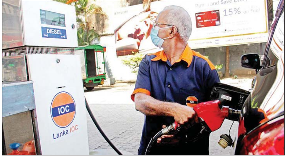
သီရိလင်္ကာနိုင်ငံ ကိုလံဘိုရှိ အလုပ်သမားတစ်ဦးက ယာဉ်တစ်စီးထဲသို့ ဒီဇယ်ဖြည့်သွင်းနေစဉ်။