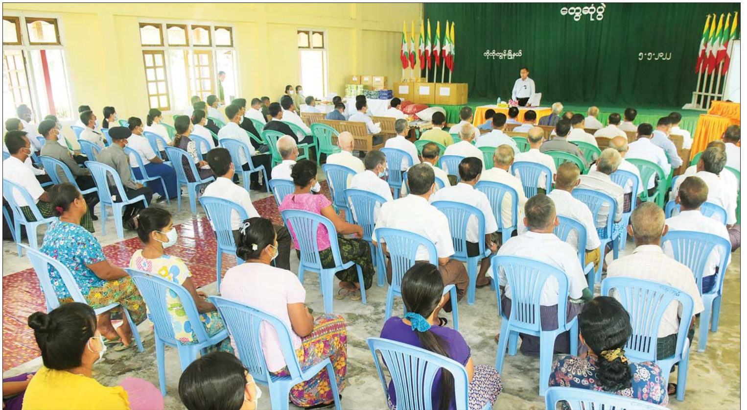
နိုင်ငံတော်စီမံအုပ်ချုပ်ရေးကောင်စီ ဒုတိယဥက္ကဋ္ဌ ဒုတိယတပ်မတော်ကာကွယ်ရေးဦးစီးချုပ် ကာကွယ်ရေးဦးစီးချုပ် (ကြည်း) ဒုတိယဗိုလ်ချုပ်မှူးကြီး စိုးဝင်း ကိုကိုးကျွန်း မြို့ရှိ ဌာနဆိုင်ရာများ၊ ဒေသခံပြည်သူများအား တွေ့ဆုံအမှာစကား ပြောကြားစဉ်။

ဦးစွာ မြို့နယ်စီမံအုပ်ချုပ်ရေးအဖွဲ့ ဥက္ကဋ္ဌ ဦးဆန်းမင်းက ကိုကိုးကျွန်းမြို့ သမိုင်းကြောင်းနှင့် အုပ်ချုပ်ရေး၊ စီးပွား ရေး၊ လူမှုရေး စသည့်ဒေသဆိုင်ရာ အခြေအနေများကို ရှင်းလင်းတင်ပြရာ နိုင်ငံတော်စီမံအုပ်ချုပ်ရေး ကောင်စီ ဒုတိယဥက္ကဋ္ဌ ဒုတိယတပ်မတော် ကာကွယ်ရေးဦးစီးချုပ် ကာကွယ်ရေး