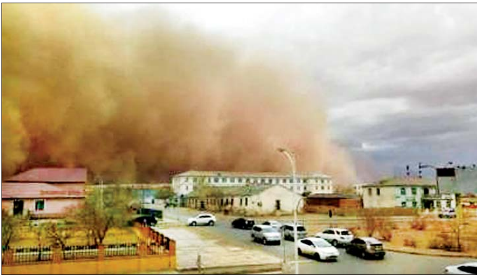
မွန်ဂိုလီးယားနိုင်ငံ၌ ဖုန်မုန်တိုင်း တိုက်ခတ်နေသည့် မြင်ကွင်းကို တွေ့ရစဉ်။

လေပြင်းမုန်တိုင်းနှင့် အဝါရောင်ဖုန်မုန်တိုင်းများသည် ဒွန်ဒိုဂိုဘီ၊ အွန်နိုဂိုဘီနှင့် ဒေါ်နိုဂိုဘီ ကဲ့သို့သော နိုင်ငံ၏ တောင်ဘက်ပိုင်းရှိ ဂိုဘီသဲကန္တာရပြည်နယ်များသို့ တိုက်ခတ်နိုင်ကြောင်းနှင့် လေတိုက်နှုန်းမှာ တစ်စက္ကန့်လျှင် ၁၈ မီတာမှ ၂၄ မီတာအထိ ရောက်ရှိနိုင်ကြောင်း ရာသီဥတုစောင့်ကြည့်ရေး အေဂျင်စီက