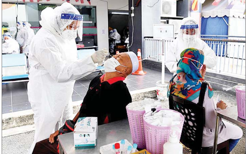
မလေးရှားနိုင်ငံ၌ ကိုဗစ်-၁၉ စစ်ဆေးရန် နှာခေါင်းတို့ဖတ်ယူနေသည်ကို တွေ့ရစဉ်။

လက်ရှိတွင် မလေးရှားနိုင်ငံ၌ ကိုဗစ်-၁၉ ကူးစက်ခံနေရသူ ၂၈၇၇၇ ဦးပြီး ၇၄ ဦးမှာ အထူးကြပ်မတ်ကုသဆောင်တွင် ကုသမှု ခံယူနေရပြီး ၄၁ ဦးမှာ အသက်ရှူ အထောက်အကူပြု ကိရိယာများ လိုအပ်နေကြောင်း သိရသည်။ ဆင်ဟွာ