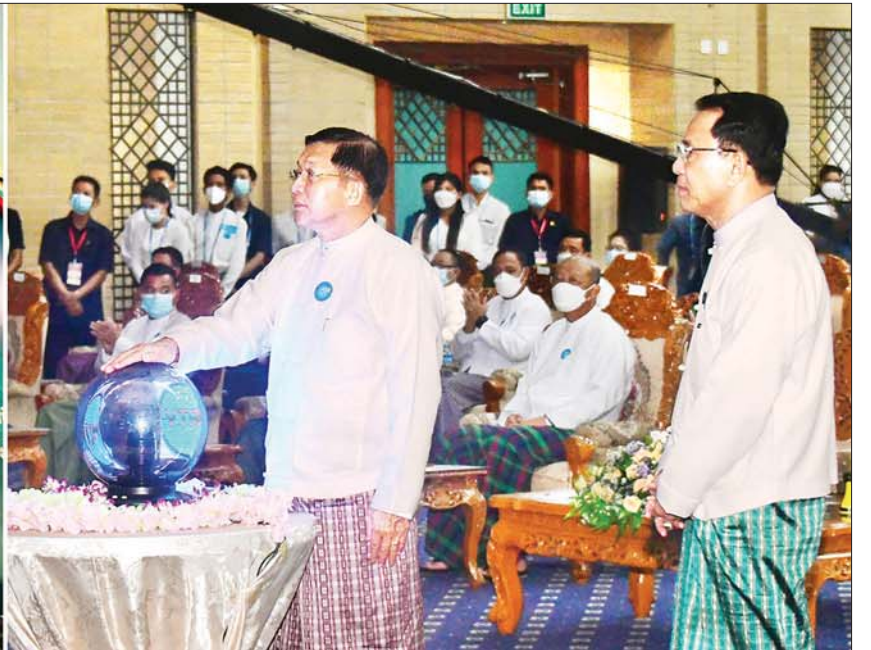
နိုင်ငံတော်စီမံအုပ်ချုပ်ရေးကောင်စီဥက္ကဋ္ဌ နိုင်ငံတော်ဝန်ကြီးချုပ် ဗိုလ်ချုပ်မှူးကြီး မင်းအောင်လှိုင် မြန်မာ့အသံနှင့် ရုပ်မြင်သံကြား MRTV Media Worldwide Mobile Satellite Data Application Services အား စက်ခလုတ်နှိပ် ဖွင့်လှစ်ပေးစဉ်။