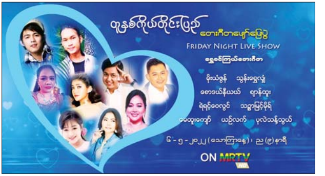
ထိုသို့ တင်ဆက်မှုကို မေ ၈ ထပ်မံ ထုတ်လွှင့်ပြသမည်ဖြစ် ရက် (တနင်္ဂနွေနေ့) နံနက် ကြောင်း သိရသည်။

မြန်မာ့အသံနှင့်ရုပ်မြင်သံကြား၏ MRTV-HD Channel မှ ထုတ်လွှင့် ပြသမည်ဖြစ်သည်။