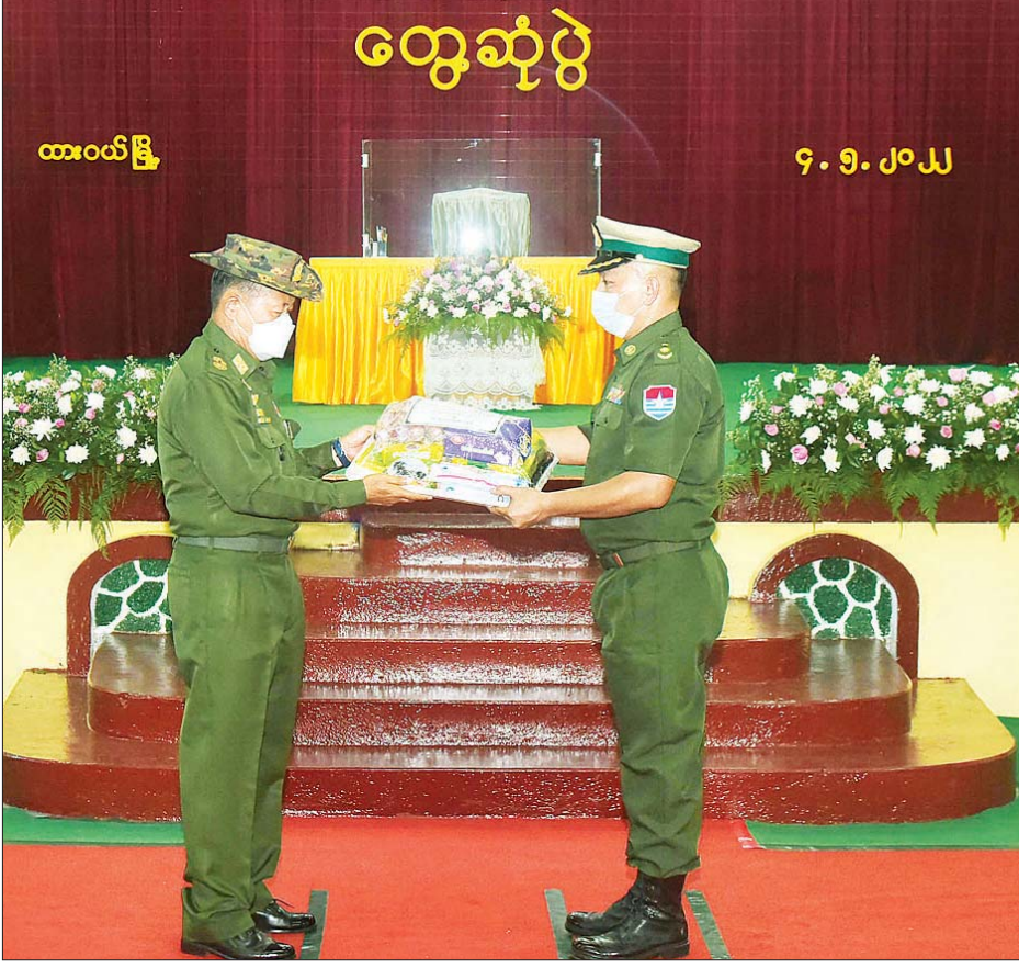
နိုင်ငံတော်စီမံအုပ်ချုပ်ရေးကောင်စီ ဒုတိယဥက္ကဋ္ဌ ဒုတိယတပ်မတော် ကာကွယ်ရေးဦးစီးချုပ် ကာကွယ်ရေး ဦးစီးချုပ်(ကြည်း) ဒုတိယဗိုလ်ချုပ်မှူးကြီး စိုးဝင်း ထားဝယ်တပ်နယ်မှ အရာရှိ၊ စစ်သည်၊ မိသားစုဝင်များ အတွက် စားသောက်ဖွယ်ရာများ ပေးအပ်စဉ်။