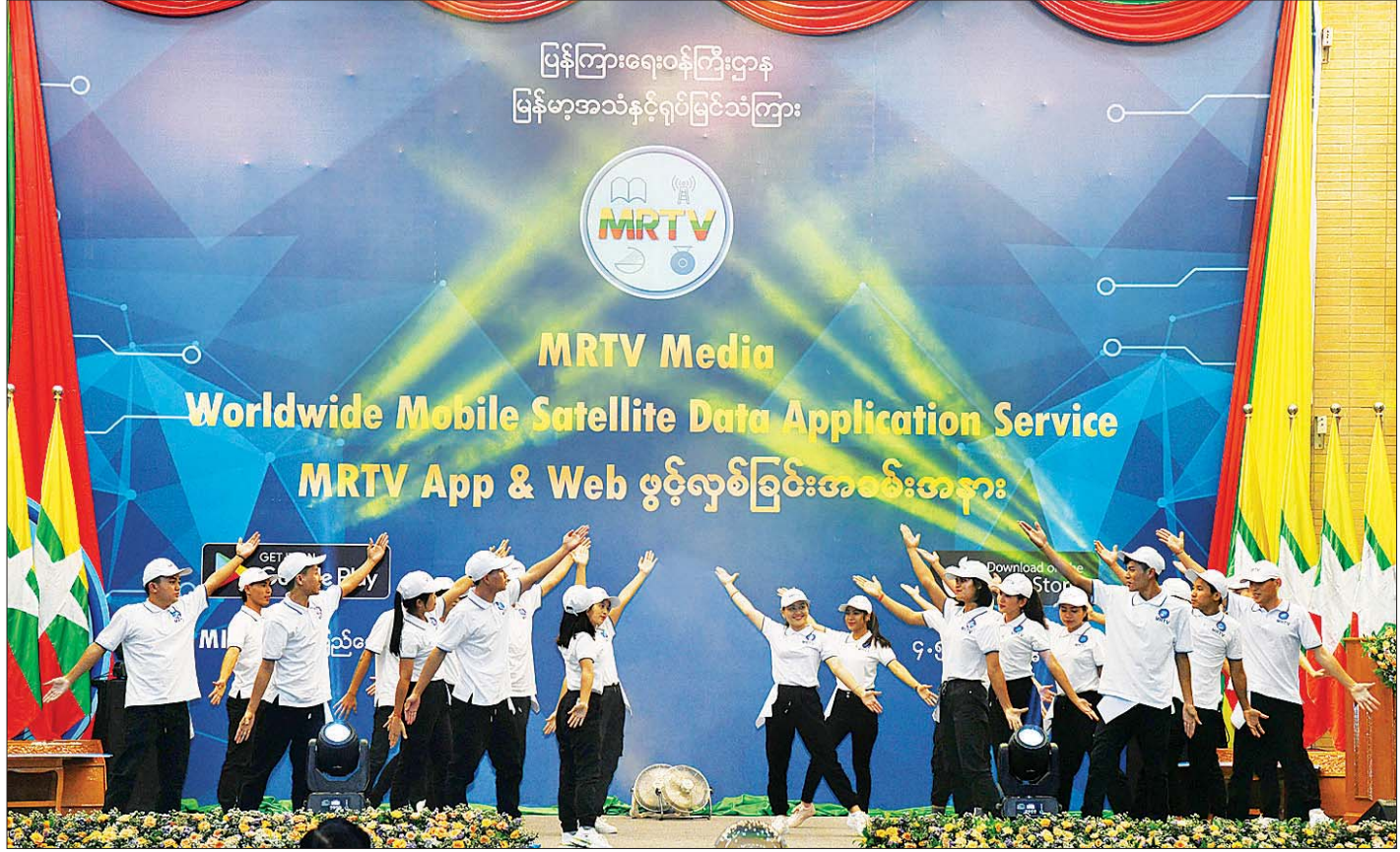
မြန်မာ့အသံနှင့် ရုပ်မြင်သံကြားဝန်ထမ်းများက “ရှင်သန်နေမည် MRTV” တေးသီချင်းဖြင့် သီဆိုကပြ ဖျော်ဖြေတင်ဆက်ကြစဉ်။

ကမ္ဘာတစ်ဝန်းကို ထုတ်လွှင့်နိုင်ခြင်း မရှိခဲ့သည်ကို သိရှိရပါကြောင်း၊ အခုအခါတွင် HD ရုပ်သံလိုင်းများ နည်းတူ ဆက်သွယ်ရေးနည်းပညာများ အသုံးပြုပြီး MRTV Media Application ကို ဆောင်ရွက်ထားခြင်း ဖြစ်သည့်အတွက် Android နှင့် IOS ဖုန်းများပေါ်တွင် ကြည့်ရှုနိုင်မည် ဖြစ်ပါကြောင်း၊ ထို့အပြင် Laptop, Desktop, iPad, Note Pad အားလုံးတွင်လည်း ကြည့်ရှုနိုင်မည်ဖြစ်သကဲ့သို့ Website တွင်လည်း MRTV ၏အစီအစဉ်များကို အချိန်နှင့်တစ်ပြေးညီ ကြည့်ရှုနိုင်မည် ဖြစ်ပါကြောင်း။ စာမျက်နှာ ၅ သို့