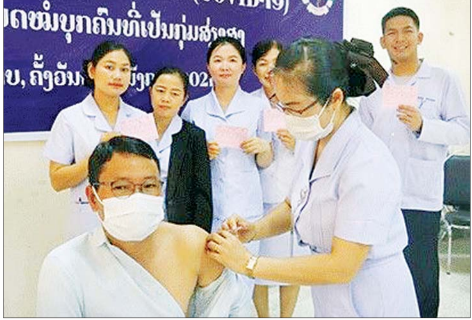
လာအိုနိုင်ငံတွင် ဒုတိယအကြိမ် ကိုဗစ်-၁၉ ကာကွယ်ဆေးထိုးပေးနေသည်ကို တွေ့ရစဉ်။

ကိုဗစ်-၁၉ ကာကွယ်ဆေးနှင့် ထိန်းချုပ်ရေး အမျိုးသားလုပ်ငန်း ကော်မတီသည် လာအိုနှင့် နိုင်ငံခြားသားများအတွက် နယ်စပ် ဝင်ပေါက်များကို ပြန်လည်ဖွင့်လှစ်ရန် အဆိုပြုချက်နှင့် ပတ်သက်ပြီး နိုင်ငံခြားသား နေထိုင်သူများ အပါအဝင် ပြည်သူ့သဘောထား အမြင်များကို လတ်တလောတွင် ဆွေးနွေးလျက်ရှိသည်။ ဆွေးနွေး အကြံပြုချက်များ ပါဝင်သော အဆိုပြုလွှာကို ဆုံးဖြတ်ချက်ချနိုင်ရန် အစိုးရထံ သို့ တင်သွင်းသွားမည်ဖြစ်သည်။ ဆင်ဟွာ