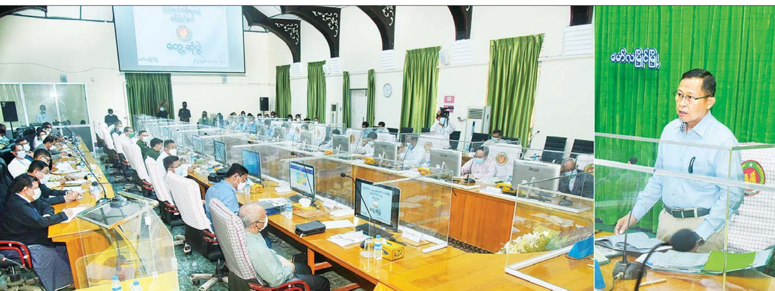
နိုင်ငံတော်စီမံအုပ်ချုပ်ရေးကောင်စီ ဒုတိယဥက္ကဋ္ဌ ဒုတိယတပ်မတော်ကာကွယ်ရေးဦးစီးချုပ် ကာကွယ်ရေးဦးစီးချုပ်(ကြည်း) ဒုတိယဗိုလ်ချုပ်မှူးကြီး စိုးဝင်း မွန်ပြည်နယ် ပြည်နယ်အစိုးရအဖွဲ့များ၊ ပြည်နယ်၊ ခရိုင်နှင့်မြို့နယ်အဆင့် ဌာနဆိုင်ရာများအား တွေ့ဆုံအမှာစကားပြောကြားစဉ်။

နေပြည်တော် မေ ၄ နိုင်ငံတော် စီမံအုပ်ချုပ်ရေး ကောင်စီ ဒုတိယဥက္ကဋ္ဌ ဒုတိယ တပ်မတော်ကာကွယ်ရေး ဦးစီးချုပ် ကာကွယ်ရေးဦးစီးချုပ်(ကြည်း) ဒုတိယဗိုလ်ချုပ်မှူးကြီး စိုးဝင်း သည် ယနေ့နံနက်ပိုင်းတွင် မွန်ပြည်နယ် ပြည်နယ်အစိုးရ အဖွဲ့များ၊ ပြည်နယ်၊ ခရိုင်နှင့် မြို့နယ်အဆင့် ဌာနဆိုင်ရာများ အား အစိုးရအဖွဲ့ရုံး အစည်းအဝေး ခန်းမတွင် တွေ့ဆုံအမှာစကား ပြောကြားသည်။ အဆိုပါ တွေ့ဆုံပွဲသို့ နိုင်ငံတော် စီမံအုပ်ချုပ်ရေး ကောင်စီ အဖွဲ့ဝင်များဖြစ်ကြသည့် စာမျက်နှာ ၆ ကော်လံ ၁ ❖