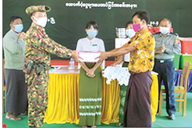
ယာယီတိုက်ပွဲရှောင် စခန်းများတွင် နေထိုင်လျက်ရှိသော ယာယီတိုက်ပွဲရှောင်ပြည်သူများကို ထောက်ပံ့ငွေများနှင့် အသုံးအဆောင်ပစ္စည်းများ ပေးအပ်

တိုင်းဒေသကြီး ချမ်းအေးသာစံမြို့နယ်ရှိ ပုဗ္ဗာ ရုံကျောင်းတိုက်သို့လည်းကောင်း၊ မွန်ပြည်နယ် ကျိုက်မရောမြို့နယ်ရှိ ဘုရားနတ်ဆူ တောင်ပေါ်ကျောင်းတိုက်သို့ လည်းကောင်း ဆရာတော်၊ သံဃာတော်များအတွက် ဆွမ်းဆန်တော်များကို တာဝန်ရှိသူများက သွားရောက် ဆက်ကပ်လှူဒါန်းခဲ့ကြကြောင်း သိရသည်။ သတင်းစဉ်