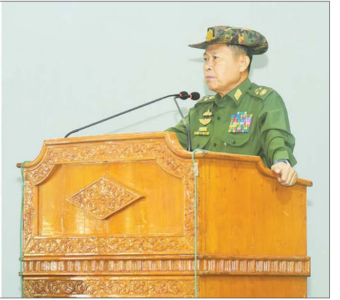
နိုင်ငံတော်စီမံအုပ်ချုပ်ရေးကောင်စီ ဒုတိယဥက္ကဋ္ဌ ဒုတိယတပ်မတော် ကာကွယ်ရေးဦးစီးချုပ် ကာကွယ်ရေးဦးစီးချုပ်(ကြည်း) ဒုတိယဗိုလ်ချုပ်မှူးကြီး စိုးဝင်း မော်လမြိုင်တပ်နယ်မှ အရာရှိ စစ်သည်၊ မိသားစုဝင်များအား တွေ့ဆုံအမှာစကားပြောကြားစဉ်။