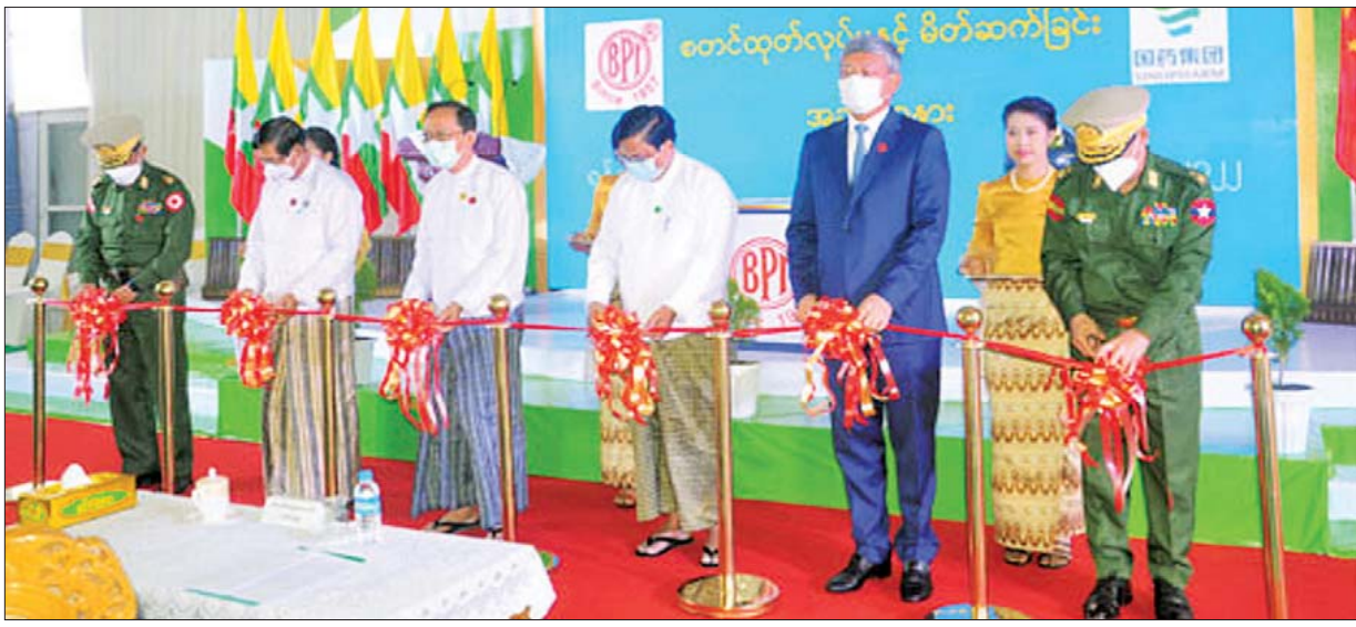
၂၀၂၂ ခုနှစ် မတ်လ ၂၃ ရက်က Myancopharm ကိုဗစ်- ၁၉ ရောဂါကာကွယ်ဆေး စတင်ထုတ်လုပ်မှုနှင့် မိတ်ဆက်ခြင်းအခမ်းအနား၌ ပြည်ထောင်စု ဝန်ကြီးများ၊ မြန်မာနိုင်ငံဆိုင်ရာ တရုတ်ပြည်သူ့သမ္မတနိုင်ငံ သံအမတ်ကြီးနှင့် တာဝန်ရှိသူများက ဖဲကြိုးဖြတ်ဖွင့်လှစ်ပေးစဉ်။