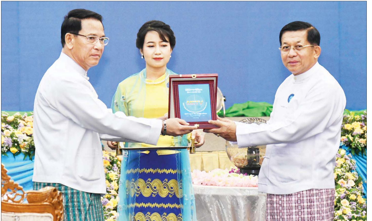
နိုင်ငံတော်စီမံအုပ်ချုပ်ရေးကောင်စီဥက္ကဋ္ဌ နိုင်ငံတော်ဝန်ကြီးချုပ် ဗိုလ်ချုပ်မှူးကြီး မင်းအောင်လှိုင်ထံ ပြည်ထောင်စုဝန်ကြီး ဦးမောင်မောင်အုန်းက MRTV Media Application ဖွင့်လှစ်ခြင်းအထိမ်းအမှတ် အမှတ်တရလက်ဆောင် ပေးအပ်စဉ်။

လူမှုစီးပွားဘဝဖွံ့ဖြိုးတိုးတက်အောင်ဖော်ဆောင်မိဒီယာကဏ္ဍအနေဖြင့်လည်း ပြည်သူများအတွက် ဒီမိုကရေစီနှင့်ပတ်သက်သည့် အသိပညာ၊ အတွေးအခေါ်များရရှိစေရန်နှင့် လူငယ်လူရွယ်များအားလုံး ပညာရေးလမ်းကြောင်းပေါ်တွင် ကောင်းမွန်စွာ ရပ်တည်နိုင်ရန်၊ ခေတ်ပညာတတ် လူငယ်များဖြစ်စေရေး ပံ့ပိုးပေးရန်၊ စေ့ဆော်တိုက်တွန်းပေးရန် လိုအပ်သလို ကျင့်ဝတ်သိက္ခာ စောင့်ထိန်းပြီး နိုင်ငံတော်နှင့် ပြည်သူအကျိုးကို ဦးထိပ်ထားကာ