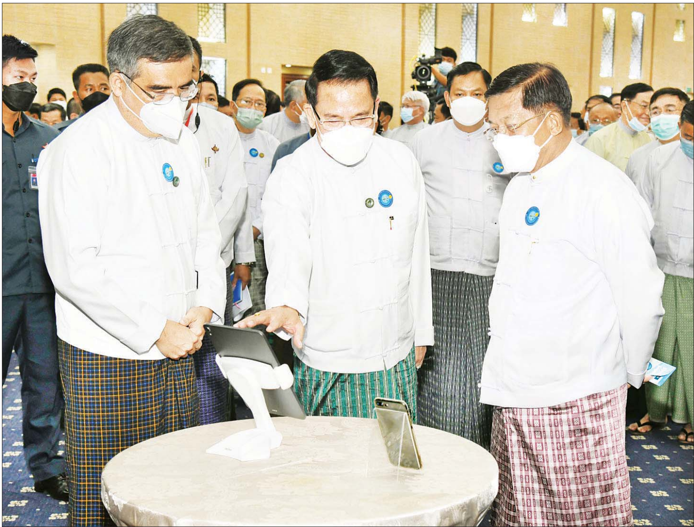
နိုင်ငံတော်စီမံအုပ်ချုပ်ရေးကောင်စီဥက္ကဋ္ဌ နိုင်ငံတော်ဝန်ကြီးချုပ် ဗိုလ်ချုပ်မှူးကြီး မင်းအောင်လှိုင်နှင့် အဖွဲ့ဝင်များ MRTV Media Worldwide Mobile Satellite Data Application Services MRTV App & Web အသုံးပြုမှုကို ကြည့်ရှုစဉ်။

ပြန်ကြားရေးဝန်ကြီးဌာန မြန်မာ့အသံနှင့် ရုပ်မြင်သံကြားအနေဖြင့်လည်း ၁၉၄၆ ခုနှစ် ဖေဖော်ဝါရီ ၁၅ ရက်တွင် ရန်ကုန်ရေဒီယို (Rangoon Radio) အမည်မှ ဗမာအသံ (Burma Broadcasting Service- BBS) အမည်ပြောင်းလဲသတ်မှတ်ခဲ့သည့် “ဗမာအသံနေ့” ကို မှတ်တမ်း မြန်မာ့အသံနှင့်ရုပ်မြင် သံကြား (Myanmar Radio and Television-MRTV) အမည်သို့ ပြောင်းလဲလာခဲ့မှုနှင့်အတူ ခေတ်အဆက် ဆက်တွင် သတင်းအချက်အလက် ပြန်ကြားပေးခြင်း၊ အသိပညာမျှဝေပေးခြင်း၊ ဖျော်ဖြေပေးခြင်းဆိုသည့် ရည်မှန်းချက်(၃)ရပ်ချမှတ်ပြီး လုပ်ငန်းတာဝန်များကို အကောင်အထည်ဖော် ဆောင်ရွက်ခဲ့ခြင်း ဖြစ်ပါ ကြောင်း။