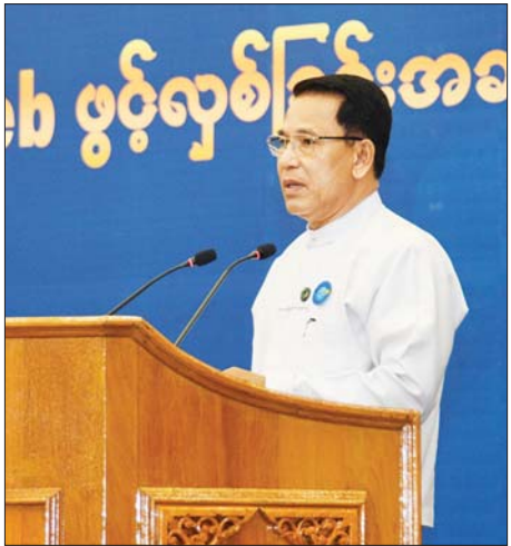
ပြည်ထောင်စုဝန်ကြီး ဦးမောင်မောင်အုန်း MRTV App & Web ဆောင်ရွက်မှုအပါအဝင် မိဒီယာကဏ္ဍ ဖွံ့ဖြိုးတိုးတက်ရေး ဆောင်ရွက်မှုအခြေအနေများ ရှင်းလင်းတင်ပြစဉ်။

တိုင်းရင်းသားပြည်သူများ၏ လူမှုစီးပွားဘဝဖွံ့ဖြိုးတိုးတက်အောင် ဖော်ဆောင်ပေးရန် လိုအပ်သည်ကိုလည်း ပြောကြားထားပြီးဖြစ်ကြောင်း။