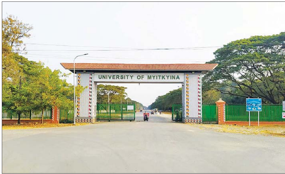
မြစ်ကြီးနားတက္ကသိုလ်။

“ပညာရေးဖြင့် ခေတ်မီဖွံ့ဖြိုးတိုးတက်သော နိုင်ငံတော်ကြီး တည်ဆောက်အံ့” ဆိုတာ ပညာရေးရဲ့ ပန်းတိုင်၊ မြန်မာ့ပညာရေး မျှော်မှန်းချက်က “မျက်မှောက်ကာလဖြစ်သော ပညာခေတ်၏ စိန်ခေါ်မှုကို ရင်ဆိုင်နိုင်သည့် အစဉ်လေ့လာသင်ယူနေသော လူ့ဘောင်အဖွဲ့အစည်းကို ဖန်တီးပေးနိုင်သည့်