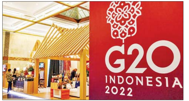
ဖေဖော်ဝါရီလက ကျင်းပပြုလုပ်ခဲ့သော ဘဏ္ဍာရေးဝန်ကြီးများ အစည်းအဝေး ပြင်ဆင်ထားမှုကို တွေ့ရစဉ်။

နယူးဒေလီ မေ ၄ နိုင်ငံအတွင်း လွန်ခဲ့သော ၂၄ နာရီက ကိုဗစ်-၁၉ ထပ်မံကူးစက်ဖြစ်ပွားသူ ၃၂၀၅ ဦး ရှိလာသောကြောင့် အိန္ဒိယနိုင်ငံတွင် မေ ၄ ရက်က ကိုဗစ်-၁၉ စုစုပေါင်းကူးစက်ဖြစ်ပွားသူ ၄၃၀၈၈၁၈ ဦး ရှိလာခဲ့ကြောင်း ကျန်းမာရေးဝန်ကြီးဌာန၏ နောက်ဆုံးထုတ်ပြန်လိုက်သော သတင်းအချက်အလက်များအရ သိရသည်။ လွန်ခဲ့သော ၂၄ နာရီက မြို့တော်ဒေလီတွင် ကိုဗစ်-၁၉ ကူးစက်ဖြစ်ပွားသူ ၁၄၁၄ ဦး ရှိသည်။ လတ်တလောတွင် မြို့တော်ဒေလီတွင် ကိုဗစ်-၁၉ ကူးစက်ဖြစ်ပွားနေသူ ၅၉၈၆ ဦး ရှိသည်။ ထို့အပြင် ကိုဗစ်-၁၉ ကြောင့် နိုင်ငံအတွင်း ထပ်မံသေဆုံးသူ ၃၁ ဦး ရှိလာသောကြောင့် ကိုဗစ်-၁၉ ကြောင့် သေဆုံးသူပေါင်းမှာ ၅၂၅၄၂၀ ရှိလာသည်။ နိုင်ငံအတွင်း လတ်တလော ကိုဗစ်-၁၉ ကူးစက်ဖြစ်ပွားနေသူ ၁၉၅၀၉ ဦး ရှိသည်။ ယခုအချိန်အထိ ကိုဗစ်-၁၉ ကပ်ရောဂါကို အောင်မြင်စွာကုသပေးနိုင်ခဲ့ပြီး ဆေးရုံမှ ဆင်းလာသူပေါင်း ၄၂၅၄၄၆၉၉ ဦး ရှိသည်။ ဆင်ဟွာ