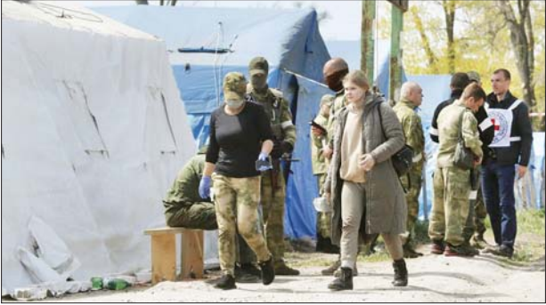
မာရီယူးလ်ရှိ လူနေအိမ်များမှ ဘေးလွတ်ရာသို့ ရွှေ့ပြောင်းကယ်ဆယ်ခဲ့ သူများအား တွေ့ရစဉ်။

ဝန်ကြီးဌာန၏ သတင်းထုတ်ပြန်ချက်အရ အရပ်သားများကို ကုလသမဂ္ဂနှင့် နိုင်ငံတကာကြက်ခြေနီအဖွဲ့သို့ လွှဲပြောင်းပေးခဲ့ကြောင်း၊