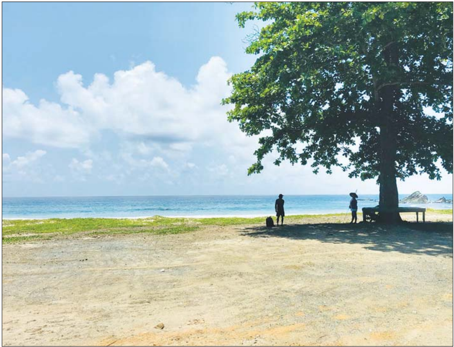
ကိုကိုးကျွန်းမြို့နယ်ရှိ ပင်လယ်ကမ်းခြေ ရှုခင်းများကို တွေ့ရစဉ်။