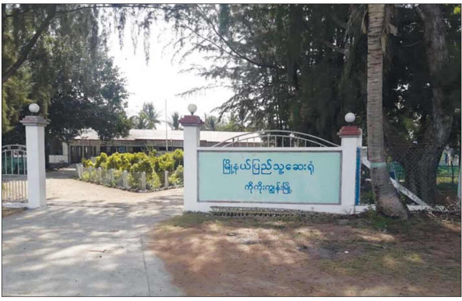
ကိုကိုးကျွန်းမြို့နယ် ပြည်သူ့ဆေးရုံ။

ကိုကိုးကျွန်းသို့ ခရီးနှင့် ၂၀၂၂ ခုနှစ် ဧပြီလ ၂၁ ရက်နေ့ နံနက် ၈ နာရီခွဲ