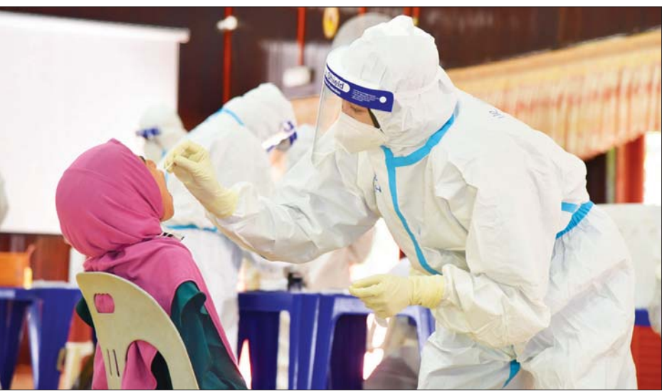
မလေးရှား၌ ကိုဗစ် -၁၉ စမ်းသပ်စစ်ဆေးရန် နှာခေါင်းတို့ဖတ် နမူနာ ရယူနေသည်ကို တွေ့ရစဉ်။

ကျန်းမာရေးဝန်ကြီးဌာနက ကိုဗစ်-၁၉ ကူးစက်ဖြစ်ပွားမှုမှ ပြန်လည်ကောင်းမွန်လာသူ ၆၀၇၇ ဦးရှိကြောင်း ဖော်ပြမှုနှင့်အတူ စုစုပေါင်း ကိုဗစ်-၁၉ ကူးစက်