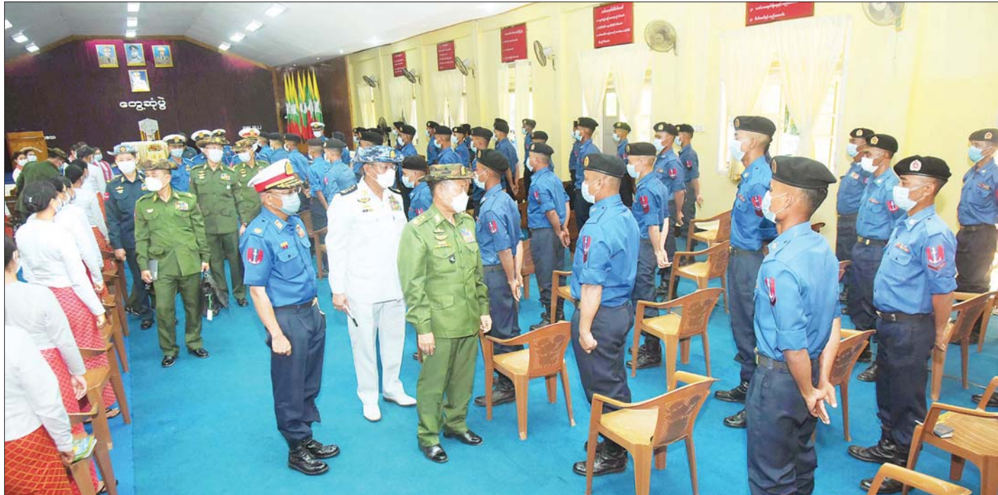
နိုင်ငံတော်စီမံအုပ်ချုပ်ရေးကောင်စီ ဒုတိယဥက္ကဋ္ဌ ဒုတိယတပ်မတော်ကာကွယ်ရေးဦးစီးချုပ်ကာကွယ်ရေးဦးစီးချုပ် (ကြည်း) ဒုတိယဗိုလ်ချုပ်မှူးကြီး စိုးဝင်း ဟိန်းဇဲတပ်နယ်ရှိ အရာရှိ၊ စစ်သည်၊ မိသားစုများအား ရင်းရင်းနှီးနှီး နှုတ်ဆက်စဉ်။

◆ တပ်မတော်၏ အသက်ခန္ဓာသည် စစ်စဉ်ကမ်းဖြစ်သည့်အပြင် လုံခြုံရေးအသိ အမြဲရှိရန်လိုအပ်သဖြင့် လုံခြုံရေးနှင့်ပတ်သက်၍ ကျိုးပေါက် မှုမရှိစေရန်၊ လက်ရှိအချိန်တွင် တပ်မတော်သည် နိုင်ငံတော်အတွက် အရေးကြီးသည့် အခန်းကဏ္ဍတွင် ပါဝင်ဆောင်ရွက်နေရသဖြင့် အဆင့် အတန်းအားလုံးသည် မိမိ၏တာဝန်၊ ဝတ္တရားများကို သိရှိကြပြီး ကိုယ်စီ လုပ်ငန်းတာဝန်များအပေါ် အလေး အနက်ထား ကျေပွန်အောင်မြင်စွာ လုပ်ကိုင်ဆောင်ရွက်ကြ