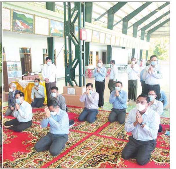
နိုင်ငံတော်စီမံအုပ်ချုပ်ရေးကောင်စီ ဒုတိယဥက္ကဋ္ဌ ဒုတိယတပ်မတော်ကာကွယ်ရေးဦးစီးချုပ် ကာကွယ်ရေးဦးစီးချုပ်(ကြည်း) ဒုတိယဗိုလ်ချုပ်မှူးကြီး စိုးဝင်း နှင့်အဖွဲ့ဝင်များ ပထက်တောင် အတုလရံသီရွှေသာလျောင်း ဘုရားကြီးအား ဖူးမြော်ကြည့်ညိကြစဉ်။