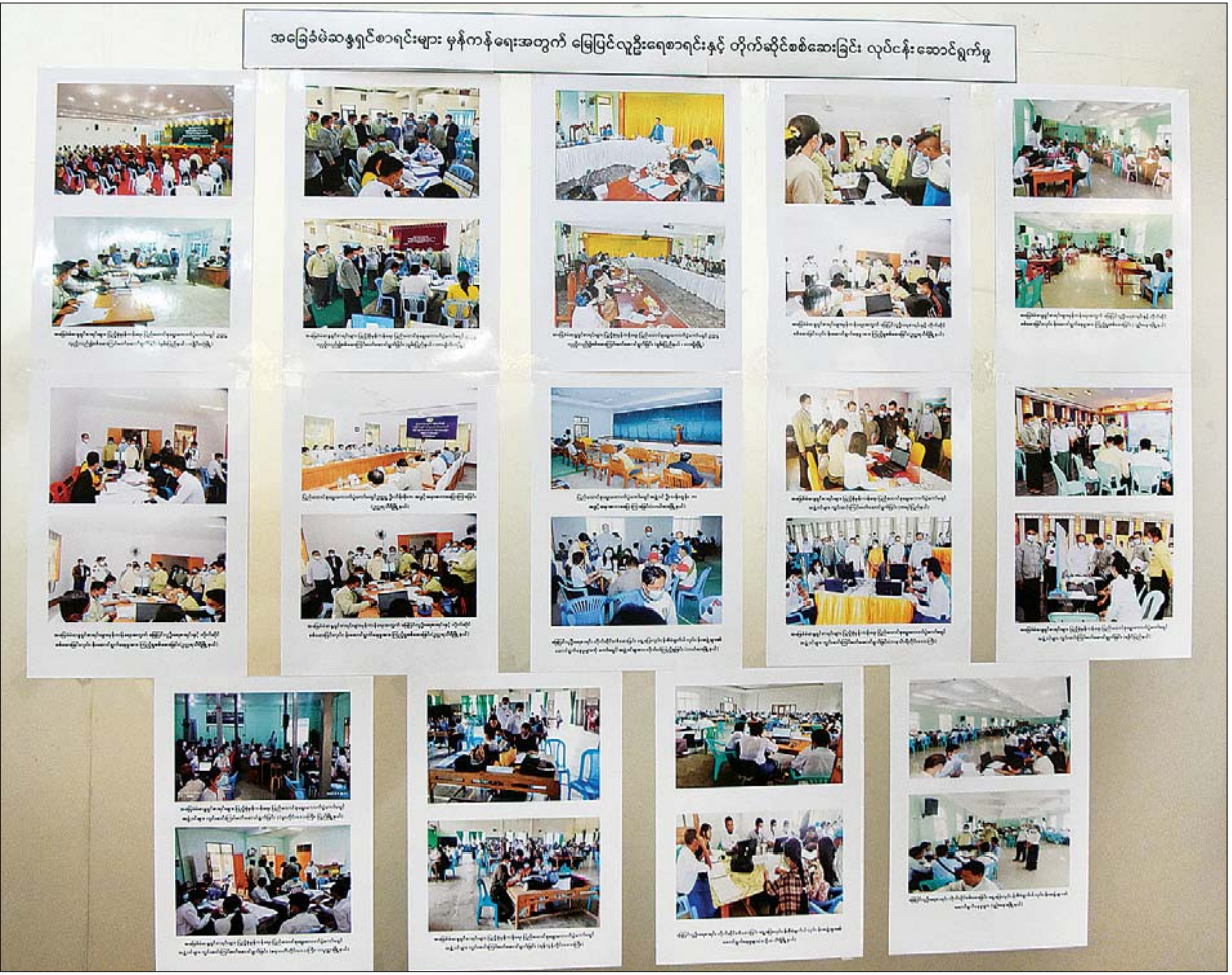
နိုင်ငံတော်စီမံအုပ်ချုပ်ရေးကောင်စီ၊ သတင်းထုတ်ပြန်ရေးအဖွဲ့၏ (၁၃) ကြိမ်မြောက် သတင်းစာရှင်းလင်းပွဲတွင် ခင်းကျင်းပြသထား သည့် မှတ်တမ်းဓာတ်ပုံများ။

ဗိုလ်ချုပ်ဇော်မင်းထွန်းက ဥပဒေနှင့်အညီ မည်သို့လျှောက်ရမည်က လုပ်ထုံးလုပ်နည်းရှိပြီးဖြစ်ကြောင်း၊ ဥပမာပြောရမည်ဆိုပါက တချို့အရာများသည် မလွတ်မကင်းဖြစ်မည်ဖြစ်ကြောင်း၊ ဘိန်းထုပ် နှင့် စိတ်ကြွဆေးပြားများမိ၍ ထောင်ကျခံရရုံတွင် စိတ်ကြွဆေးပြား ဥပဒေပြဋ္ဌာန်းထားသည်ကို မိမိမသိရှိပါဟုပြော၍မရကြောင်း၊ ထိုသို့ ပြောပါက ဥပဒေနှင့် နှိုင်းစက်သည်ဟူ၍ ဖြစ်လာဦးမည်ဖြစ်ကြောင်း၊ သတင်းထောက်ကြီး ပြောသည့်ကိစ္စသည် ယခုဖြစ်ပြီးသွားပြီဖြစ် ကြောင်း၊ ဖြစ်သွားသည်များကို စုံစမ်း၍သာရမည်ဖြစ်ကြောင်း၊ တချို့ကိစ္စများအားလုံးကို မိမိအကုန်မသိနိုင်ပါကြောင်း၊ တချို့ကိစ္စ များသည် လက်ငင်းဖြေရှင်း၍မရပါကြောင်း၊ မိမိပြောသည်ကို Quote လုပ်ပြီး ဗိုလ်ချုပ်ဇော်မင်းထွန်းက မည်သို့ပြောသည်၊ ထို့ကြောင့် မိမိတို့ရပိုင်ခွင့်ရှိသည်ဟုဖြစ်၍မရပါကြောင်း၊ ဗိုလ်ချုပ် ဇော်မင်းထွန်းက မည်သို့ပြောသည်၊ ထို့ကြောင့် ရပိုင်ခွင့်မရှိဟုလည်း ပြော၍မရပါကြောင်း၊ တရားဥပဒေသည် ၂ မျိုးရှိကြောင်း၊ တရား ဥပဒေတွင် တရားမမှုများတွင် နံပါတ်တစ်အနေဖြင့် ရပိုင်ခွင့်နှင့် ပတ်သက်ပြီး မိမိတို့၏ရပိုင်ခွင့်ကို မတရားမဆုံးရှုံးစေခြင်းကို ကာကွယ်ကြောင်း၊ နံပါတ်နှစ်အနေဖြင့် မိမိတို့၏ရပိုင်ခွင့်နှင့် ပတ်သက်ပြီး တရားသေရယူမှုဖြစ်ခြင်းကိုကာကွယ်ကြောင်း၊ နှစ်ခုလုံးကို မိမိတို့က ကာကွယ်ရမည်ဖြစ်ကြောင်း၊ ထိုကိစ္စနှင့် ပတ်သက်ပြီး မတရားဆုံးရှုံးခဲ့ပါသလား၊ မတရားမဆုံးရှုံးခဲ့ဘူးလား ဟု မိမိမသိပါကြောင်း၊ တရားစွာရယူခဲ့သည်၊ မတရားရယူခဲ့သည်ကို မိမိမသိနိုင်ကြောင်း၊ ဥပဒေနှင့်အညီရယူသည်၊ ဥပဒေနှင့်မညီဘဲရ ယူသည်၊ ဥပဒေနှင့်အညီအခြေချသည်၊ ဥပဒေနှင့်မညီဘဲ အခြေချ သည်၊ ထိုသို့ပြုလုပ်ခြင်းအားဖြင့် ၎င်းကိုမတရားဆုံးရှုံးစေသလားဟု