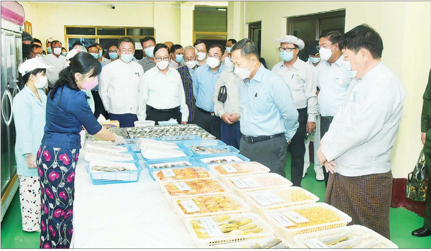
နိုင်ငံတော်စီမံအုပ်ချုပ်ရေးကောင်စီ ဒုတိယဥက္ကဋ္ဌ ဒုတိယတပ်မတော်ကာကွယ်ရေးဦးစီးချုပ် ကာကွယ်ရေးဦးစီးချုပ်(ကြည်း) ဒုတိယဗိုလ်ချုပ်မှူးကြီး စိုးဝင်း နှင့်အဖွဲ့ဝင်များ ငါး၊ ပုစွန် (တန် ၁၀၀၀) အအေးခန်းစက်ရုံအတွင်း ငါး၊ ပုစွန်များ ထုပ်ပိုးထားမှုအဆင့်ဆင့်ကို ကြည့်ရှုစဉ်။

ထို့နောက် နိုင်ငံတော်စီမံအုပ်ချုပ်ရေးကောင်စီ ဒုတိယဥက္ကဋ္ဌ ဒုတိယတပ်မတော်ကာကွယ်ရေးဦးစီး ချုပ် ကာကွယ်ရေးဦးစီးချုပ်(ကြည်း)နှင့် အဖွဲ့ဝင်များ သည် စာမျက်နှာ ၆ သို့