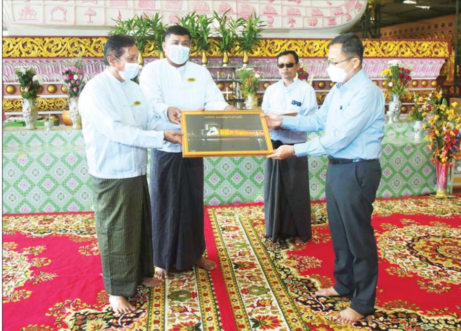
နိုင်ငံတော်စီမံအုပ်ချုပ်ရေးကောင်စီ ဒုတိယဥက္ကဋ္ဌ ဒုတိယတပ်မတော်ကာကွယ်ရေးဦးစီးချုပ် ကာကွယ်ရေး ဦးစီးချုပ်(ကြည်း) ဒုတိယဗိုလ်ချုပ်မှူးကြီး စိုးဝင်း အား ဘုရားဂေါပကအဖွဲ့ဝင်များက ဘုရားကြီး၏ ပုံတော်ကို ဓမ္မလက်ဆောင်အဖြစ် ပေးအပ်စဉ်။

ထမ်းဆောင်နိုင်စေရန်၊ ဒေသခံတိုင်းရင်းသားများ၏ ပညာရေး၊ ကျန်းမာရေး၊ လူမှုရေးကဏ္ဍများ ပိုမို တိုးတက်ကောင်းမွန်လာစေပြီး လုံခြုံစိတ်ချသော လူမှုဘဝကို ပိုင်ဆိုင်နိုင်စေရန် စသည့် ရည်ရွယ်ချက် များနှင့်အညီ ၁၉၉၈ ခုနှစ်မှ စတင်ဆောက်လုပ်ခဲ့ရာ ၂၀၀၀ ပြည့်နှစ်တွင် ဆောက်လုပ်ပြီးခဲ့ကြောင်း၊ ရေထွက်ပစ္စည်းများကို အရည်အသွေး၊ အရွယ်အစား ရွေးချယ်စစ်ဆေးခြင်း၊ ဝယ်ယူပြီး ဆေးကြောသန့်စင် ခြင်း၊ စနစ်တကျထုပ်ပိုးခြင်း၊ အေးခဲတုံးများပြုလုပ် ခြင်း၊ အအေးခန်းများအတွင်းသို့ သို့လောင်ခြင်းများ ကို အဆင့်ဆင့် ပြုလုပ်ရောင်းချလျက်ရှိသည့်အပြင် မြိတ်ဒေသတစ်ခုလုံးရှိ ငါးဖမ်းစက်လှေ ၁၈၀၀ နီးပါး တို့၏ ဖမ်းဆီးရမိ ငါး/ပုစွန်များကိုလည်း ဝယ်ယူပေး လျက်ရှိကြောင်း၊ ဂျပန်၊ အမေရိကန်၊ ဟောင်ကောင်၊ တရုတ်၊ မလေးရှား၊ ဗီယက်နမ်၊ ထိုင်း စသော ပြည်ပ နိုင်ငံများသို့လည်း အမှာစာများအတိုင်း GAQP လုပ်ငန်းစဉ်နှင့်အညီ သတ်မှတ်စံချိန်စံညွှန်းအတိုင်း တင်ပို့ရောင်းချလျက်ရှိကြောင်း၊ နှစ်စဉ် ရေငန် ငါးမျိုးစုံ တန် ၁၀၀၀ ခန့်၊ ပုစွန်တန် ၆၀၀ ခန့်၊ ကဏန်းပျော့တန် ၂၉၀ ခန့်ကို ပြည်ပနိုင်ငံများသို့