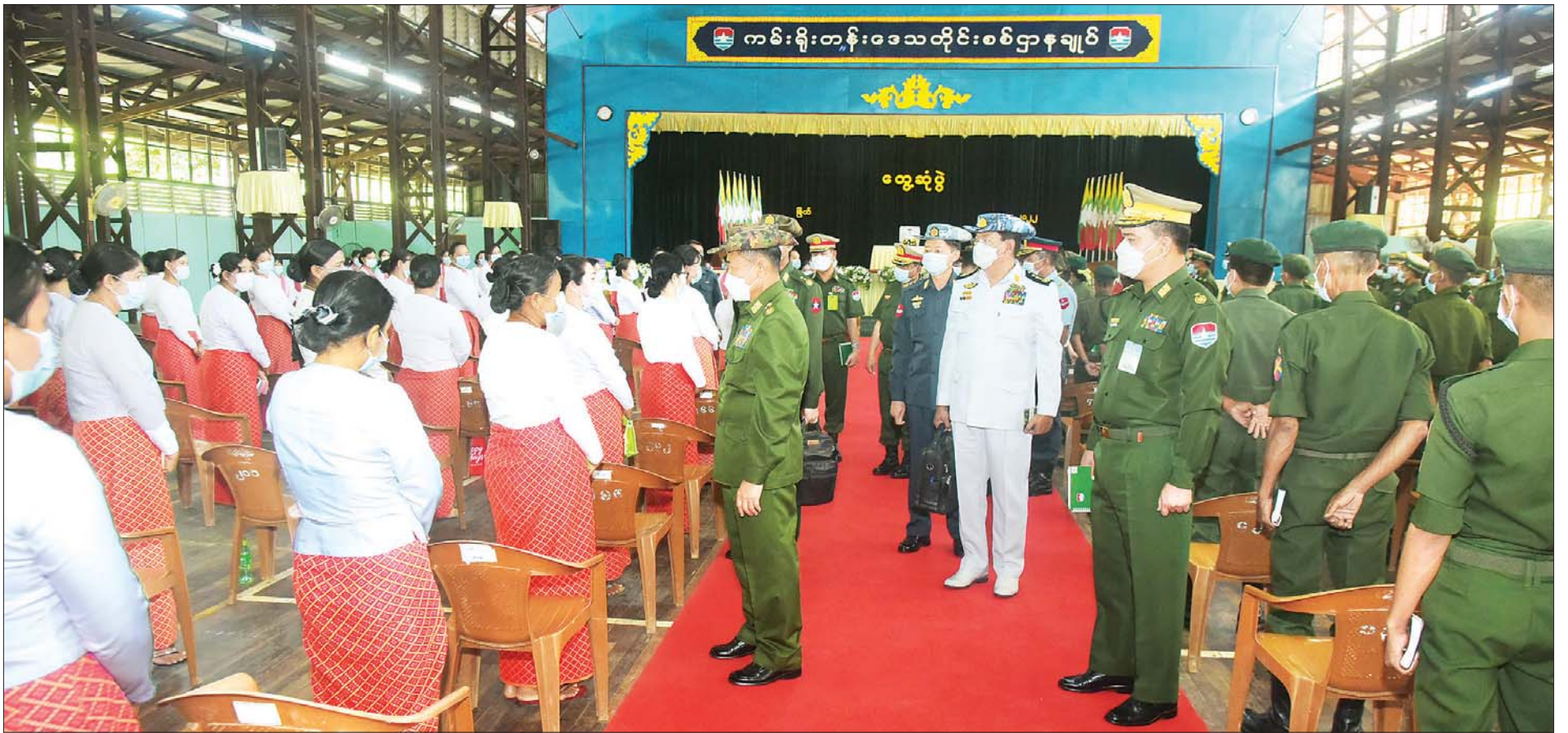
နိုင်ငံတော်စီမံအုပ်ချုပ်ရေးကောင်စီ ဒုတိယဥက္ကဋ္ဌ ဒုတိယတပ်မတော်ကာကွယ်ရေးဦးစီးချုပ် ကာကွယ်ရေးဦးစီးချုပ်(ကြည်း) ဒုတိယဗိုလ်ချုပ်မှူးကြီး စိုးဝင်း၊ မြိတ်တပ်နယ်ရှိ အရာရှိ၊ စစ်သည်မိသားစုဝင်များ၊ သင်တန်းသား စစ်သည်များအား ရင်းရင်းနှီးနှီး နှုတ်ဆက်စဉ်။

၄။ တစ်နိုင်ငံလုံး ထာဝရငြိမ်းချမ်းရေးရရှိရေးအတွက် တစ်နိုင်ငံလုံး ပစ်ခတ်တိုက်ခိုက်မှုရပ်စဲရေး သဘောတူစာချုပ် (NCA) ပါ သဘောတူညီချက်များအတိုင်း ဖြစ်နိုင်သမျှ အလေးထား လုပ်ဆောင်သွားမည်။ ၅။ အရေးပေါ်ကာလဆိုင်ရာ ပြဋ္ဌာန်းချက်များနှင့်အညီ ဆောင်ရွက်ပြီးစီးပါက ဖွဲ့စည်းပုံအခြေခံဥပဒေ (၂၀၀၈ ခုနှစ်)နှင့်အညီ လွတ်လပ်ပြီး တရားမျှတသော ပါတီစုံဒီမိုကရေစီ အထွေထွေရွေးကောက်ပွဲအား ပြန်လည်ကျင်းပ၍ အနိုင်ရသည့်ပါတီအား ဒီမိုကရေစီစံနှုန်းများနှင့်အညီ နိုင်ငံတော်တာဝန်အား လွှဲအပ်နိုင်ရေး ဆက်လက်ဆောင်ရွက်သွားမည်။