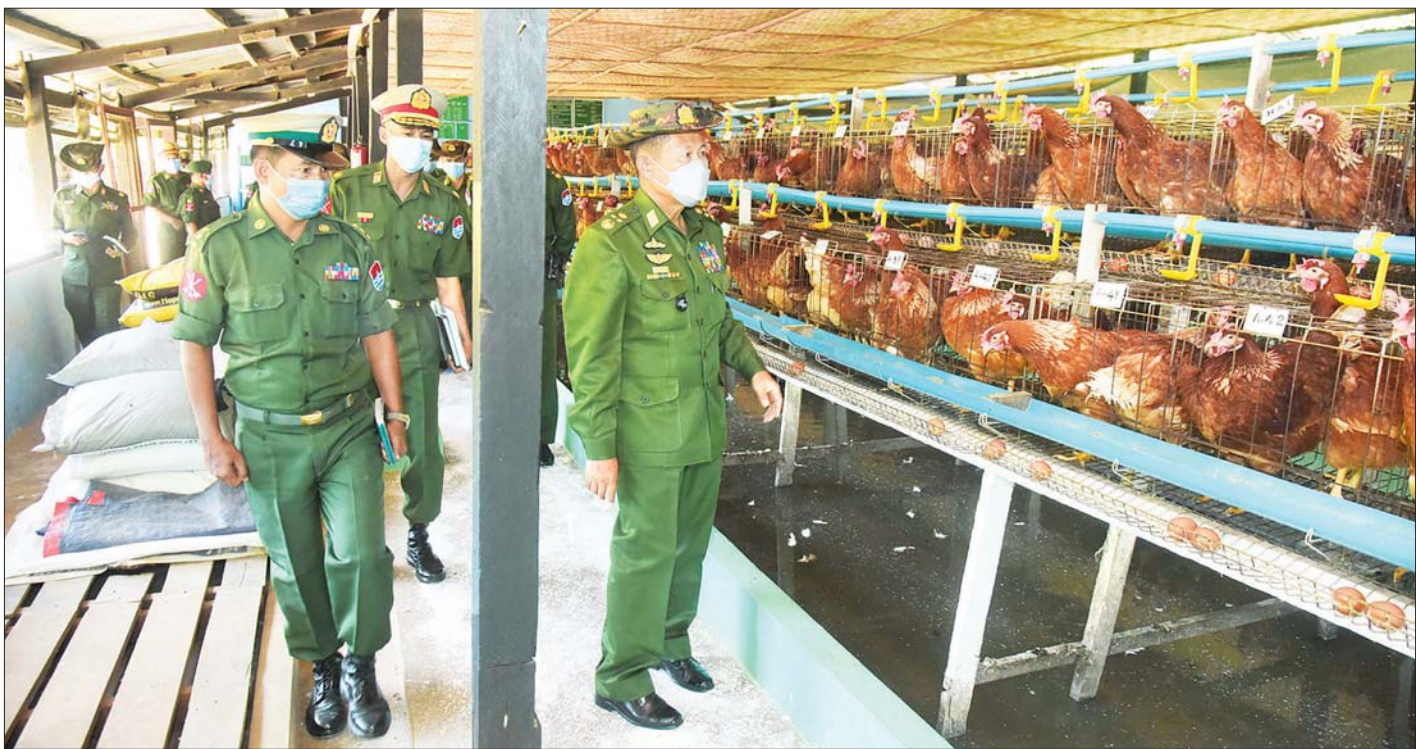
နိုင်ငံတော်စီမံအုပ်ချုပ်ရေးကောင်စီ ဒုတိယဥက္ကဋ္ဌ ဒုတိယတပ်မတော်ကာကွယ်ရေးဦးစီးချုပ် ကာကွယ်ရေးဦးစီးချုပ်(ကြည်း) ဒုတိယဗိုလ်ချုပ်မှူးကြီး စိုးဝင်းနှင့် အဖွဲ့ဝင်များ ပလောက်တပ်နယ် နယ်မြေခံသင်တန်းကျောင်းရှိ ဘက်စုံမွေးမြူရေးစခန်းတွင် ကြက်များ မွေးမြူထားမှုကို ကြည့်ရှုစစ်ဆေးစဉ်။

နိုင်ငံတော်စီမံအုပ်ချုပ်ရေးကောင်စီအနေဖြင့် နိုင်ငံတော်အား တာဝန်ယူထိန်းသိမ်းခဲ့သည့် ၁ နှစ်နှင့် ၃ လ ကာလအတွင်း အကြမ်းဖက်အဖွဲ့များအနေဖြင့် နိုင်ငံတော်အား အလုံးစုံပျက်သုဉ်းရေးဦးတည်ချက်ဖြင့် ဆန့်ကျင်ဘက်အဖွဲ့အစည်းမျိုးစုံက နည်းမျိုးစုံဖြင့် ကြိုးပမ်းလာခဲ့ကြောင်း၊ တည်ငြိမ်မှုကို လိုလားသည့် ပြည်သူလူထု၊ သစ္စာရှိဝန်ထမ်းများ၊ လုံခြုံရေးတပ်ဖွဲ့ဝင်များနှင့် တိုင်းဒေသကြီးနှင့် ပြည်နယ်အစိုးရအဖွဲ့များက ညီညွတ်သော အင်အားကြောင့် ၎င်းတို့၏ ရည်မှန်းချက် ပျက်ပြားသွားချိန်တွင် အင်အားခိုင်မာတောင့်တင်းသည့် တပ်မတော်ကို ဖြည့်စွက်ဆက်တိုက်ကြိုးပမ်းလာကြောင်း၊ သို့သော် တပ်မတော်၏ ရေပက်မဝင်သော စည်းလုံးညီညွတ်မှုကြောင့် ခိုင်မာသော အဖွဲ့အစည်းအဖြစ် ရပ်တည်နိုင်သည်ကို