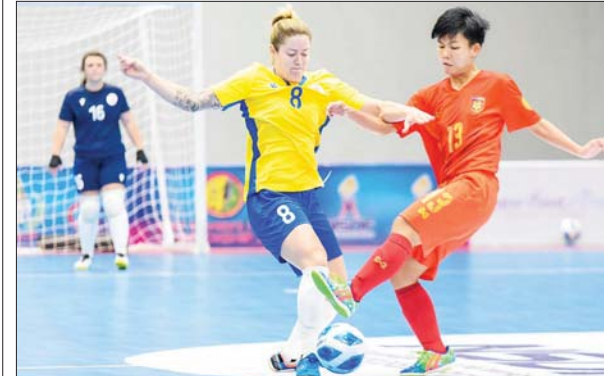
မြန်မာ့လက်ရွေးစင် အမျိုးသမီးဖူဆယ်အသင်း ထိုင်းဖိတ်ခေါ် ပြိုင်ပွဲ ယှဉ်ပြိုင်နေစဉ်။