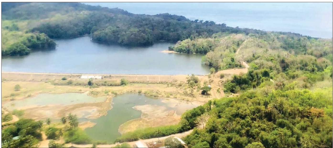
ကိုကိုးကျွန်း ရေလှောင်တံခံ။

ပထဝီအနေ အထားအရ ကိုကိုးကျွန်းမြို့နယ်သည် တောင်မှ မြောက်သို့ ၇ မိုင်ခန့် ရှည်လျားပြီး စတုရန်း မိုင်အားဖြင့် ၁၄ ဒသမ ၅၆ မိုင်ခန့် ရှိနေပါသည်။ မြောက်ဘက်တွင် ဘင်္ဂလားပင်လယ်အော်၊ စလစ်ပါ (ဘီနပ်)ကျွန်း၊ မင်္ဂလာ(မီးပြ)ကျွန်းတို့နှင့် နယ်နိမိတ် ချင်း ထိစပ်နေပြီး အရှေ့ဘက်တွင် ကပ္ပလီပင်လယ်၊ ကြွက်ကျွန်း၊ တောင်ဘက်တွင် ကပ္ပလီပင်လယ်၊ ဂျယ်ရီကျွန်းနှင့် အိန္ဒိယနိုင်ငံပိုင် အက်ဒမန်ကျွန်းစု တို့နှင့် ထိစပ်နေသည်။ အနောက်ဘက်တွင်မူ ဘင်္ဂလားပင်လယ်အော်၊ ကိုကိုးလေးကျွန်းတို့ တည်ရှိနေကြောင်း တွေ့မြင်ခဲ့ရသည်။ ပင်လယ်ရေ မျက်နှာပြင်အထက် ပျမ်းမျှ ၁၂ ပေရှိပြီး အမြင့်ဆုံး နေရာမှာ အမြင့် ၃၆၆ ပေရှိ ရွှေရင်စို့တောင် ဖြစ်ပါ သည်။