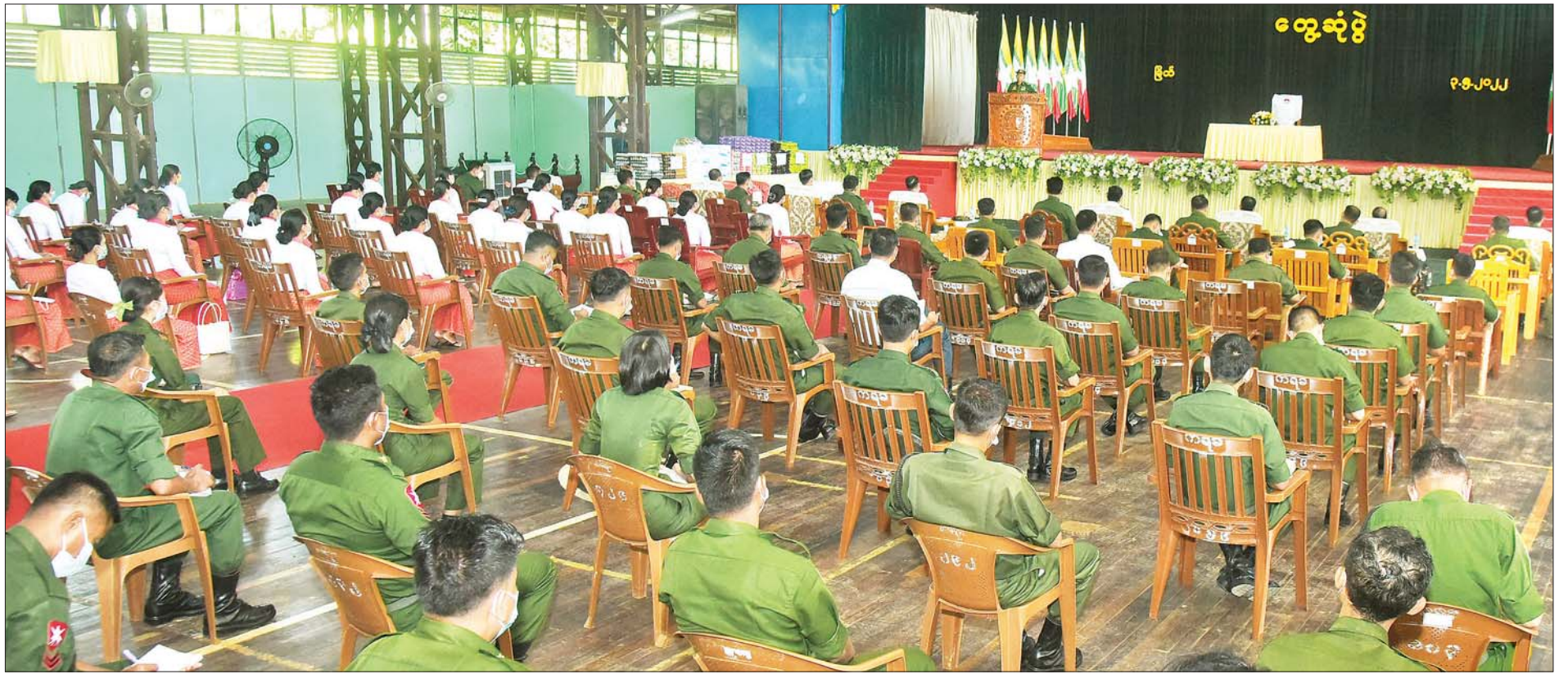
နိုင်ငံတော်စီမံအုပ်ချုပ်ရေးကောင်စီ ဒုတိယဥက္ကဋ္ဌ ဒုတိယတပ်မတော်ကာကွယ်ရေးဦးစီးချုပ် ကာကွယ်ရေးဦးစီးချုပ်(ကြည်း) ဒုတိယဗိုလ်ချုပ်မှူးကြီး စိုးဝင်း မြတ်တပ်နယ်ရှိ အရာရှိ၊ စစ်သည်မိသားစုဝင်များအား တွေ့ဆုံအမှာစကား ပြောကြားစဉ်။

ရှေ့ဖိုးမှ ဦးစွာ နိုင်ငံတော်စီမံအုပ်ချုပ်ရေးကောင်စီ ဒုတိယဥက္ကဋ္ဌ ဒုတိယတပ်မတော်ကာကွယ်ရေးဦးစီးချုပ် ကာကွယ်ရေးဦးစီးချုပ်(ကြည်း)က အမှာစကား ပြောကြားရာတွင် တပ်မတော်၏ အသက်ခန္ဓာသည် စစ်စဉ်ကမ်းဖြစ်သည့်အပြင် လုံခြုံရေးအသိ အမြဲ ရှိရန်လိုအပ်သဖြင့် လုံခြုံရေးနှင့်ပတ်သက်၍ ကျိုးပေါက်မှုမရှိစေရန်လိုကြောင်း၊ လက်ရှိအချိန်တွင် တပ်မတော်သည် နိုင်ငံတော်အတွက် အရေးကြီးသည့် အခန်းကဏ္ဍတွင် ပါဝင်ဆောင်ရွက်နေရသဖြင့် အဆင့် အတန်းအားလုံးသည် မိမိ၏တာဝန်၊ ဝတ္တရားများကို သိရှိကြပြီး ကိုယ်စီလုပ်ငန်းတာဝန်များအပေါ် အလေး အနက်ထား ကျေပွန်အောင်မြင်စွာ လုပ်ကိုင်ဆောင် ရွက်ကြရန်လိုကြောင်း၊ အသိမှန်မှ အလုပ်မှန်ပြီး အောင်မြင်နိုင်မည်ဖြစ်ကြောင်း၊ လုပ်ငန်းတာဝန် ထမ်းဆောင်ရာတွင် ယုံကြည်မှုဖြင့် ပိုင်နိုင်ကျွမ်းကျင် စွာ ဆောင်ရွက်နိုင်ရန်မှာ လေ့ကျင့်ရေးသည် အရေး ကြီးကြောင်း၊ လေ့ကျင့်မှုပိုင်နိုင်မှုသာ ယုံကြည်မှုရပြီး ကျွမ်းကျင်မှုရှိ၍ ကျွမ်းကျင်မှုမှတစ်ဆင့် အောင်မြင်မှု ကို ဆွတ်ခူးနိုင်မည်ဖြစ်ကြောင်း၊ အချိန်နှင့်အမျှ ပြောင်းလဲတိုးတက်နေသည့် စစ်မှုသိပ္ပံနည်းပညာ