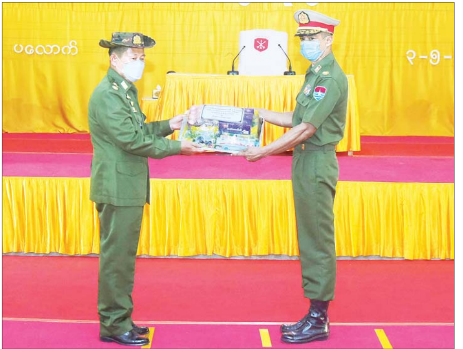
နိုင်ငံတော်စီမံအုပ်ချုပ်ရေးကောင်စီ ဒုတိယဥက္ကဋ္ဌ ဒုတိယတပ်မတော်ကာကွယ်ရေးဦးစီးချုပ် ကာကွယ်ရေး ဦးစီးချုပ်(ကြည်း) ဒုတိယဗိုလ်ချုပ်မှူးကြီး စိုးဝင်း ပလောက်တပ်နယ်ရှိ အရာရှိ၊ စစ်သည်၊ မိသားစုများ အတွက် စားသောက်ဖွယ်ရာပစ္စည်းများ ပေးအပ်စဉ်။