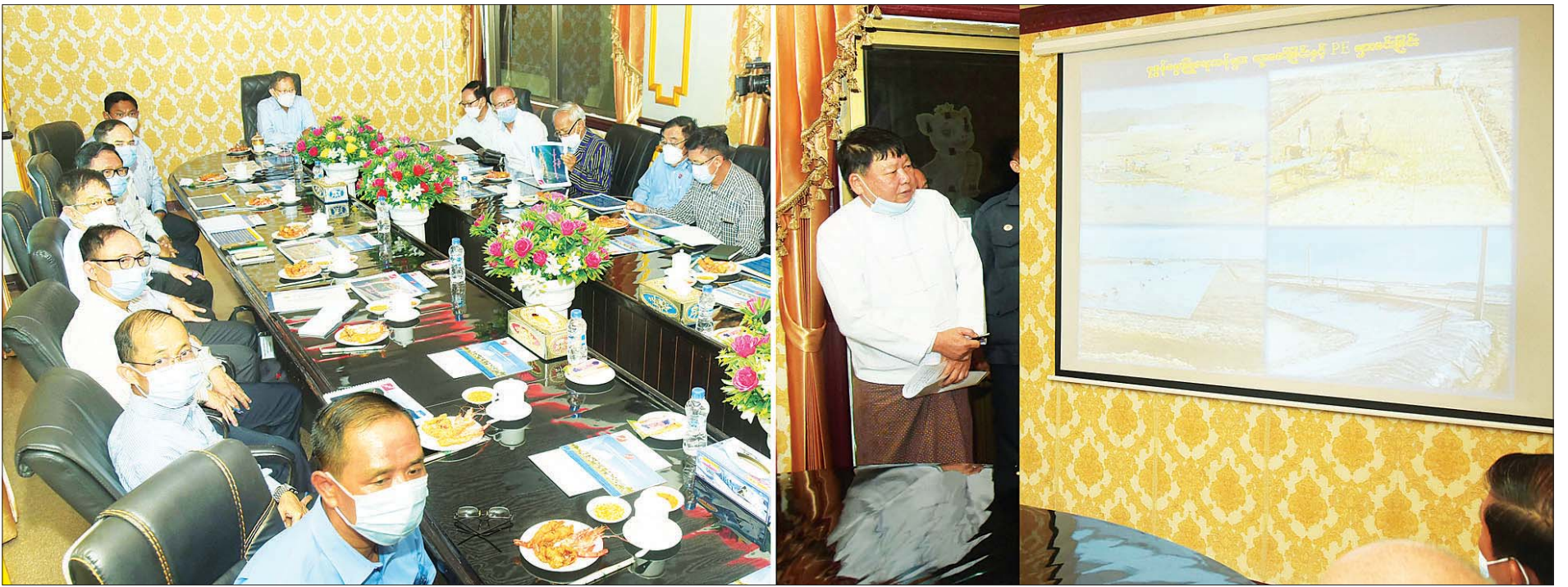
နိုင်ငံတော်စီမံအုပ်ချုပ်ရေးကောင်စီ ဒုတိယဥက္ကဋ္ဌ ဒုတိယတပ်မတော်ကာကွယ်ရေးဦးစီးချုပ် ကာကွယ်ရေးဦးစီးချုပ်(ကြည်း) ဒုတိယဗိုလ်ချုပ်မှူးကြီး စိုးဝင်း အား တာဝန်ရှိသူတစ်ဦးက လုပ်ငန်းဆောင်ရွက်မှုများကို ရှင်းလင်းတင်ပြစဉ်။