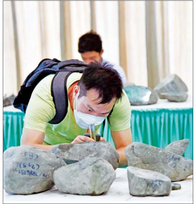
မြန်မာ့ကျောက်မျက်ရတနာပြပွဲတွင် ကျောက်မျက်၊ ကျောက်စိမ်းအတွဲများကို ရတနာကုန်သည်များ ကြည့်ရှုလေ့လာနေစဉ်။

အမေရိကန်ဒေါ်လာ၊ ယူရို၊ ယွမ်ငွေတို့ဖြင့် ပေးချေသွားရမည်ဖြစ်သည်။