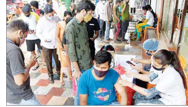
အိန္ဒိယနိုင်ငံ၌ ကျန်းမာရေးဝန်ထမ်းတစ်ဦးက ကိုဗစ်-၁၉ ကာကွယ်ဆေး ထိုးနှံပေးနေသည်ကို တွေ့ရစဉ်။

ကျန်းမာလာသူ အရေအတွက်မှာ ၄၂၅၃၄၇၉ ဦး ရှိလာကြောင်း တရားဝင်အချက်အလက်များအရ သိရသည်။ ဆင်ယာ