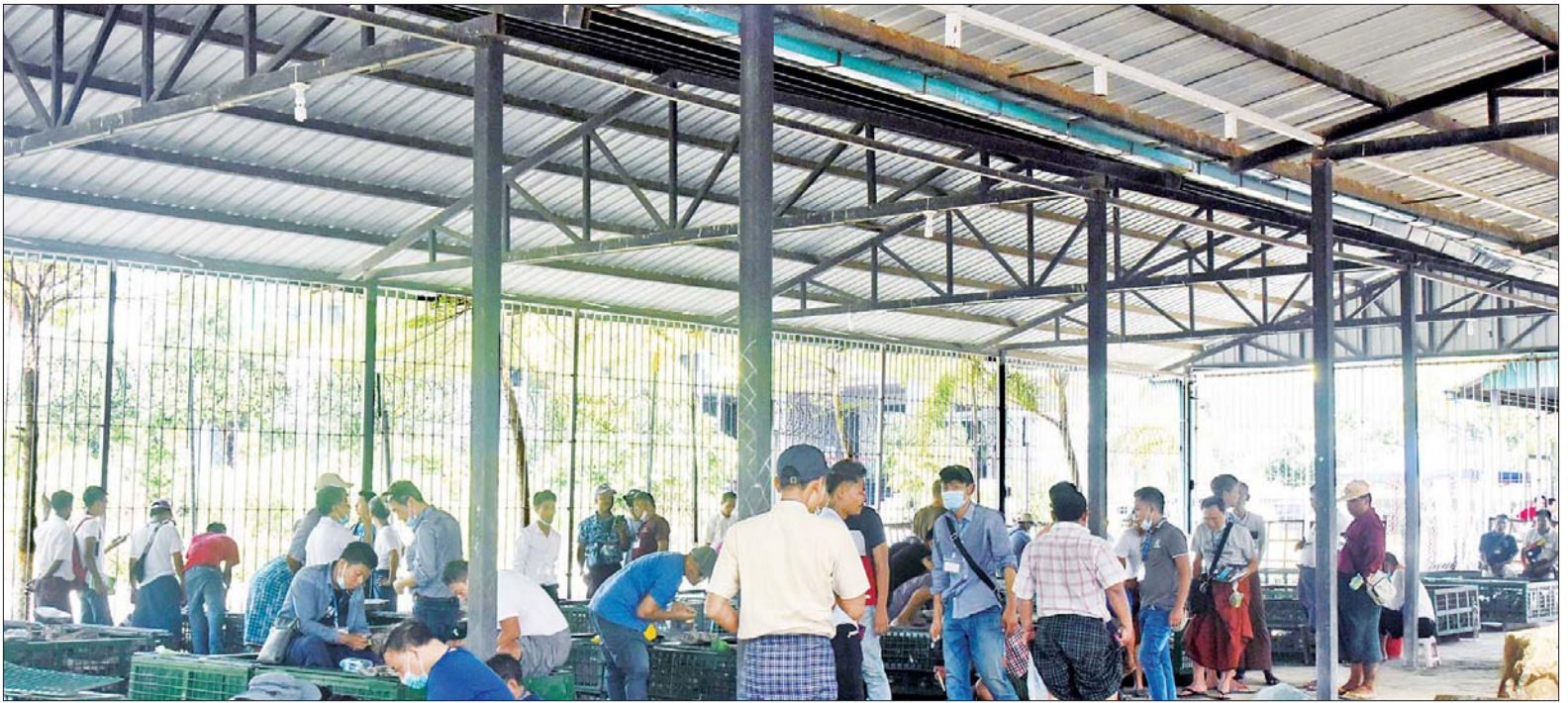
(၅၇) ကြိမ်မြောက် မြန်မာ့ကျောက်မျက်ရတနာပြပွဲတွင် ခင်းကျင်းပြသထားသည့် ကျောက်မျက်ရတနာများကို ပြည်တွင်း၊ ပြည်ပ ရတနာကုန်သည်များ ကြည့်ရှုစဉ်။

ယခုပြပွဲတွင် ပုလဲအတွဲများကို အမေရိကန် ဒေါ်လာဖြင့် ကြမ်းခင်းဈေး သတ်မှတ်ထားရှိပြီး ငွေပေးချေရာတွင် ပြည်ပရတနာကုန်သည်များက အမေရိကန်ဒေါ်လာ၊ ယွမ်ငွေတို့ဖြင့် လည်းကောင်း၊ ပြည်တွင်း ရတနာကုန်သည်များက အမေရိကန်ဒေါ်လာ၊ ယွမ်၊ ကျပ်ငွေတို့ဖြင့် လည်းကောင်း ပေးချေရမည်ဖြစ်ပြီး ကျောက်မျက်၊ ကျောက်စိမ်းအတွဲများကို ယူရိုငွေဖြင့် ကြမ်းခင်းဈေး သတ်မှတ်ထားရှိကာ ရတနာကုန်သည်များသည်