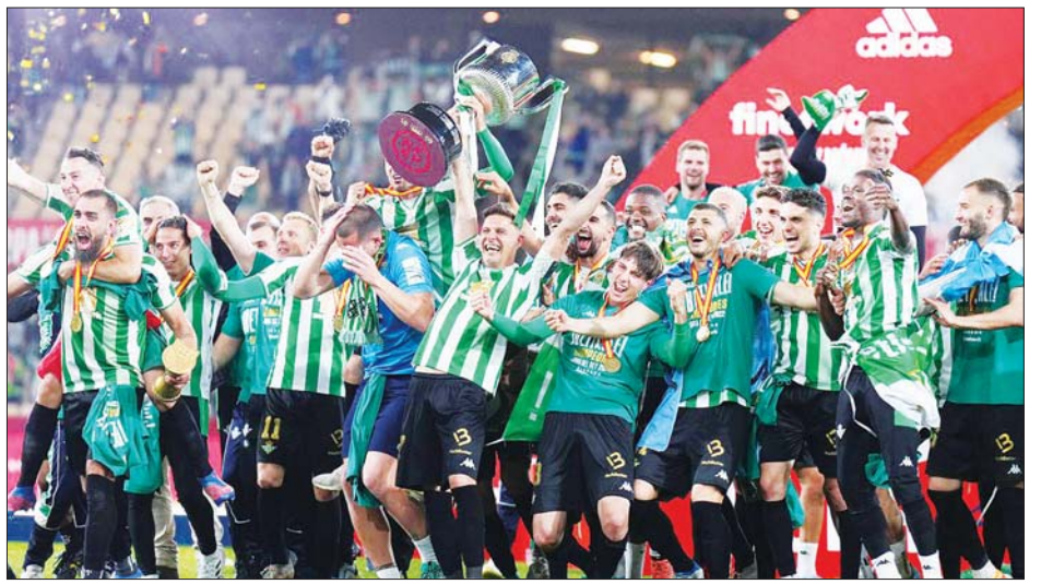
ဆုဖလားလက်ခံရယူပြီးနောက် ဘက်တစ်အသင်းသားများ အောင်ပွဲခံနေစဉ်။

ထို့ကြောင့် ဘက်တစ်အသင်း သည် ကိုပါဒယ်ရေးဖလားကို ၂၀၀၅ ခုနှစ်နောက်ပိုင်း ပထမဆုံးအကြိမ် ဆွတ်ခူးနိုင်ခဲ့သည်။ ဘက်တစ် အသင်းအနေဖြင့် ကိုပါဒယ်ရေး ဖလား ဆွတ်ခူးနိုင်ခြင်းမှာ အသင်း သမိုင်းတစ်လျှောက် အဓိကဖလား လေးကြိမ်မြောက် ဆွတ်ခူးနိုင်ခဲ့ခြင်း ဖြစ်သည်။ ဘက်တစ်အသင်းသည် ယခုဖလား မဆွတ်ခူးမီ ၁၉၃၄-၃၅ ခုနှစ်က လာလီဂါဖလား တစ်ကြိမ်၊ ၁၉၇၇ ခုနှစ်နှင့် ၂၀၀၅ ခုနှစ်တွင် စပိန်ဖလား နှစ်ကြိမ် ဆွတ်ခူးထား သည်။ ထို့အပြင် အသင်းနည်းပြ ပယ်လီဂရီနိုသည် ၂၀၁၅-၂၀၁၆