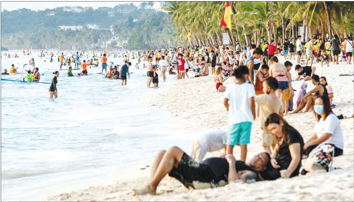
ဘိုရာကေးကျွန်းရှိ အဖြူရောင်သဲသောင်ပြင်သို့ အပန်းဖြေခရီးလာရောက်ကြသော နိုင်ငံခြားသားခရီးသွားများကို တွေ့ရစဉ်။

ဖိလစ်ပိုင်နိုင်ငံမှာ ဘိုရာကေးကျွန်းဟာ နိုင်ငံခြားသားခရီးသွားတွေကို ဆွဲဆောင်ရာ ကမ္ဘာ့ထိပ်တန်းနေရာတစ်ခုအဖြစ် ဆက်လက်တည်ရှိနေပါတယ်။ ဒီကျွန်းကို မတ်လမှာ နိုင်ငံခြားသားခရီးသွား ၁၅၀၀၀၀ ကျော်လာရောက်လည်ပတ်ခဲ့ကြပါတယ်။ ဒါဟာ ကိုဗစ်-၁၉ ကပ်ရောဂါမဖြစ်ခင် ၂၀၁၉ ခုနှစ်မှာ ဝင်ရောက်ခဲ့တဲ့ ခရီးသွားအရေအတွက် နီးပါးရှိပါတယ်။