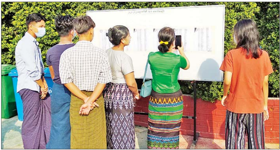
မန္တလေးမြို့ ချမ်းအေးသာစံမြို့နယ်ရှိ အမှတ်(၁၆) အခြေခံပညာအထက်တန်းကျောင်းတွင် စာမေးပွဲအောင်စာရင်းများကို လာရောက်ကြည့်ရှုနေကြသည့် ကျောင်းသား ကျောင်းသူများနှင့် မိဘများအား တွေ့ရစဉ်။

၂၀၂၁-၂၀၂၂ ပညာသင်နှစ်အတွက် မတ်လအတွင်းက ကျင်းပခဲ့သည့် အခြေခံပညာအဆင့် Grade 1 (ပထမတန်း)မှ Grade-10(နဝမတန်း)အထိ စာမေးပွဲအောင်စာရင်းများကို ယနေ့နံနက်ပိုင်းက မန္တလေးမြို့ရှိ အခြေခံပညာကျောင်းများတွင် ထုတ်ပြန်ကြေညာပေးထားကြောင်း သိရသည်။