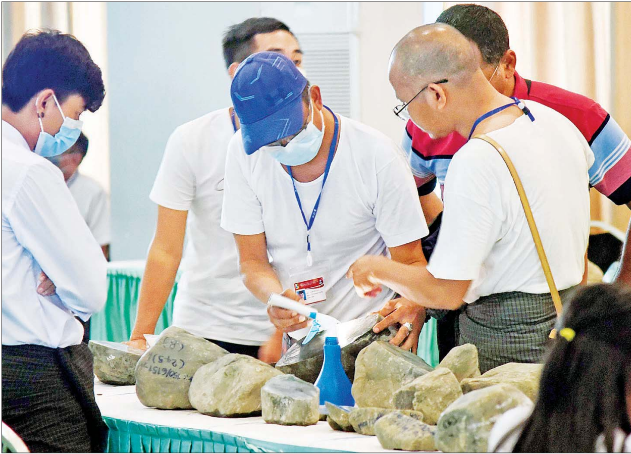
(၅၇) ကြိမ်မြောက် မြန်မာ့ကျောက်မျက်ရတနာပြပွဲတွင် ကျောက်စိမ်း၊ ကျောက်မျက်ရတနာများကို ရတနာကုန်သည်များ စိတ်ကြိုက်လေ့လာကြည့်ရှုစဉ်။