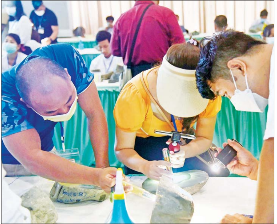
မြန်မာ့ကျောက်မျက်ရတနာပြပွဲ၌ ကျောက်မျက်၊ ကျောက်စိမ်းအတွဲများကို ပြည်တွင်း၊ ပြည်ပ ရတနာကုန်သည်များ စိတ်ကြိုက်ကြည့်ရှုလေ့လာကြစဉ်။