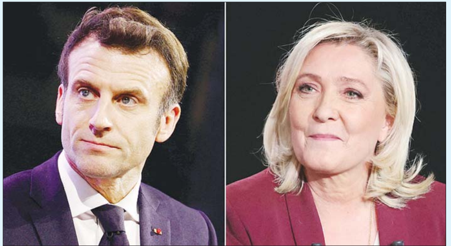
ပြင်သစ်သမ္မတရွေးကောက်ပွဲ ဝင်ရောက်ယှဉ်ပြိုင်ကြသည့် ပြင်သစ်သမ္မတအီမန် ရှူရယ် မက်ရွန်နှင့် သမ္မတ ကိုယ်စားလှယ်လောင်း မယ်ရီ လီပန်။

ပြင်သစ်နိုင်ငံ ဖွဲ့စည်းပုံအခြေခံဥပဒေ၏ ထုတ်ပြန်ကြေညာချက်အရ ပြင်သစ်သမ္မတရွေးကောက်ပွဲအတွက် ပထမအကျော့ မဲရလဒ်