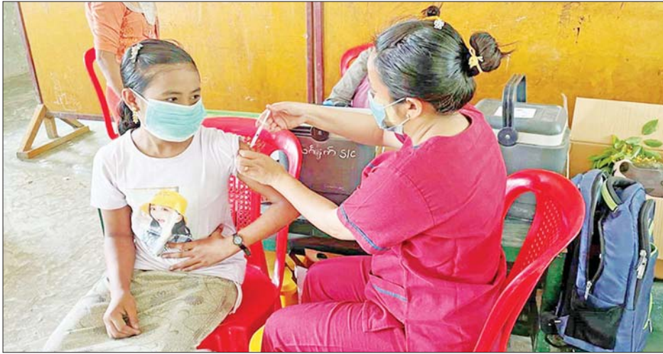
လျက်ရှိသည်။ ထိုသို့ ဆောင်ရွက်လျက်ရှိရာ ယနေ့တွင် ရှမ်းပြည်နယ်(အရှေ့ပိုင်း) မိုင်းဆတ်မြို့နယ်နှင့် မိုင်းခတ်မြို့နယ်တို့၌ ဒေသခံပြည်သူ ၁၂၂ ဦး၊ ဧရာဝတီတိုင်းဒေသကြီးအတွင်းရှိ မြို့နယ် ၂၆ မြို့နယ် ၌ ဒေသခံပြည်သူ ၂၇၅၈၃ ဦး၊ ရခိုင်ပြည်နယ်နှင့်

နေပြည်တော် ဧပြီ ၂၄ တိုင်းဒေသကြီးနှင့် ပြည်နယ်အသီးသီး၌ သံဃာတော်များ၊ သာသနာ့နယ်ဝင်သီလရှင်များ၊ ဘာသာရေးခေါင်းဆောင်များအပါအဝင် လူမျိုးမရွေး ဘာသာမရွေး အသက် ၄၀ အထက် ဒေသခံပြည်သူများ၊ အကျဉ်းသား အကျဉ်းသူများ၊ မသန်စွမ်းသူများ၊ တိုင်းရင်းသားလက်နက်ကိုင်အဖွဲ့များ၊ နာတာရှည်ရောဂါ အခံရှိသူများ၊ ကယ်ဆယ်ရေးစခန်းများ၊ ယာယီတိုက်ပွဲရှောင်စခန်းများအတွင်းရှိ ပြည်သူများ၊ အသက် ၁၂ နှစ်အထက် အခြေခံပညာအလယ်တန်းနှင့် အထက်တန်းအဆင့် ကျောင်းသား ကျောင်းသူများစသည့် ဦးတည်အုပ်စုများ သတ်မှတ်၍ တပ်မတော်မှ ဆေးအဖွဲ့များ၊ ပြည်သူ့ဆေးရုံများမှ ဆရာဝန်များ၊ သူနာပြုများ၊ ကျန်းမာရေးဝန်ထမ်းများနှင့် စေတနာ့ဝန်ထမ်းများက ကာကွယ်ဆေးထိုးခြင်း လုပ်ငန်းများကို ဆောင်ရွက်ပေး