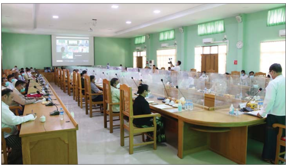
နေကြာတိုးချဲ့စိုက်ပျိုးရေးအတွက် ပြည်နယ်ဝန်ကြီးချုပ် ဆွေးနွေးပြောကြားစဉ်။

အထွက်နှုန်းကောင်းစေရန် မျိုးကောင်းရန်လိုအပ်သည့်အတွက် စိုက်ပျိုးရေးဦးစီးဌာနက မျိုးပြောင်းလဲစိုက်ပျိုးနိုင်ရေး စီစဉ်ဆောင်ရွက်သွားစေလိုကြောင်း၊ လယ်မြေတွင် စပါးရိတ်သိမ်းပြီး