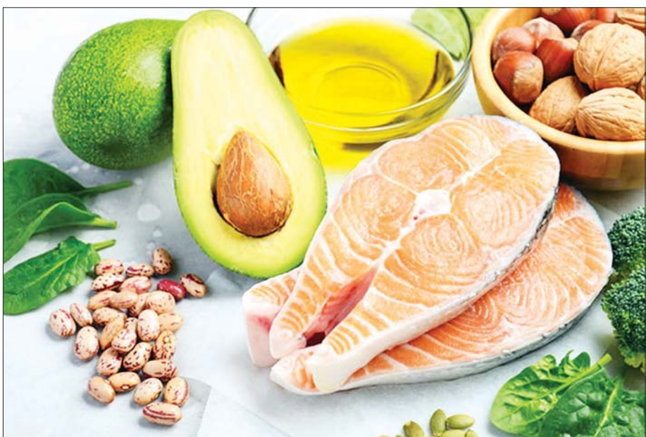
ကိုလက်စထရော လျော့ကျစေနိုင်သော အစားအစာများ။

ကိုလက်စထရောသည် ခန္ဓာကိုယ်အတွက် မရှိ မဖြစ်အရေးပါသော အဆီဓာတ်တစ်မျိုး ဖြစ်သည်။ ထို့ကြောင့် ကိုလက်စထရောသည် ရှိသင့်သော အဆီဓာတ်တစ်မျိုးဟု ဆိုရပေမည်။ သို့သော်