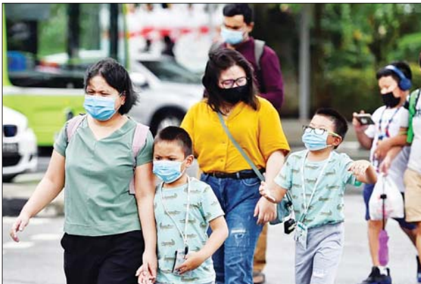
စင်ကာပူနိုင်ငံ၌ ပါးစပ်၊ နှာခေါင်းစည်းတပ်ဆင်သွားလာနေသူများကို တွေ့ရစဉ်။

စင်ကာပူနိုင်ငံ၌ ဧပြီ ၂၄ ရက်တွင် ကိုဗစ်-၁၉ ရောဂါဖြင့် ထပ်မံသေဆုံးသူမရှိသော်လည်း ကိုဗစ်-၁၉ ရောဂါဖြင့် သေဆုံးသူ စုစုပေါင်းမှာ ၁၃၂၅ ဦးရှိကြောင်း ကျန်းမာရေး ဝန်ကြီးဌာနက ထုတ်ပြန်ဖော်ပြထားသည်။ ဆင်ယာ