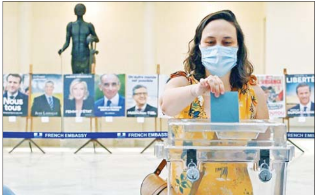
ပြင်သစ်သမ္မတရွေးကောက်ပွဲအတွက် မဲပေးနေသူတစ်ဦးကို တွေ့ရစဉ်။

ပါရီ ဧပြီ ၁၀ ပြင်သစ်နိုင်ငံ၌ ၂၀၂၂ ခုနှစ် သမ္မတရွေးကောက်ပွဲအတွက် မဲပေးခြင်းကို ဧပြီ ၁၀ ရက် ဒေသစံတော်ချိန် နံနက် ၈ နာရီတွင် စတင်ခဲ့ကြောင်း သိရသည်။ ပြင်သစ်နိုင်ငံ၌ လက်ရှိသမ္မတ အီမန်နျူရယ် မက်ရွန်အပါအဝင် သမ္မတကိုယ်စားလှယ်လောင်း ၁၂ ဦးထဲမှ နောက်ထပ် သမ္မတတာဝန် ငါးနှစ်ထမ်းဆောင်မည့် သမ္မတသစ်ကို မဲပေးသူ ၄၈ ဒသမ ၈ သန်းက ရွေးချယ်မဲပေးမည်ဖြစ်သည်။ ပြင်သစ်နိုင်ငံ၌ မဲရုံတော်တော်များများကို ဒေသစံတော်ချိန် ည