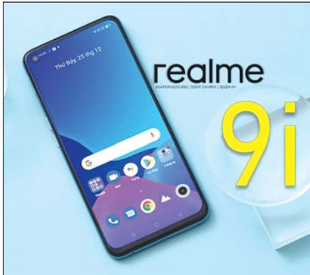
ဈေးနှုန်းက ကျပ် ၃၉၉၉၀၀ ဖြစ်ပြီး ယခုရက်ပိုင်း စတင်ရောင်းချချိန်ကနေ ဧပြီလကုန်အထိအတွင်းမှာ အပိုလက်ဆောင် အစီအစဉ်တွေနဲ့ ရောင်းချနေပါတယ်။ ကျော်ဇော်ဦး