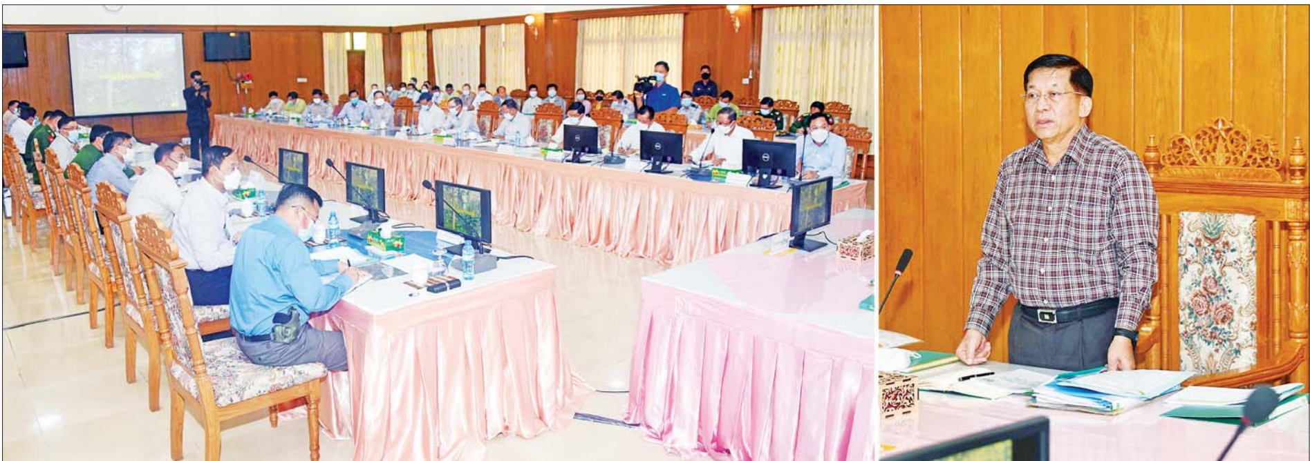
နိုင်ငံတော်စီမံအုပ်ချုပ်ရေးကောင်စီဥက္ကဋ္ဌ နိုင်ငံတော်ဝန်ကြီးချုပ် ဗိုလ်ချုပ်မှူးကြီး မင်းအောင်လှိုင် ပြင်ဦးလွင်မြို့ရှိ ကော်ဖီလုပ်ငန်းရှင်များနှင့် တွေ့ဆုံဆွေးနွေးစဉ်။

၄။ တစ်နိုင်ငံလုံး ထာဝရငြိမ်းချမ်းရေးရရှိရေးအတွက် တစ်နိုင်ငံလုံး ပစ်ခတ်တိုက်ခိုက်မှုရပ်စဲရေး သဘောတူစာချုပ် (NCA) ပါ သဘောတူညီချက်များအတိုင်း ဖြစ်နိုင်သမျှ အလေးထား လုပ်ဆောင်သွားမည်။ ၅။ အရေးပေါ်ကာလဆိုင်ရာ ပြဋ္ဌာန်းချက်များနှင့်အညီ ဆောင်ရွက်ပြီးစီးပါက ဖွဲ့စည်းပုံအခြေခံဥပဒေ (၂၀၀၈ ခုနှစ်)နှင့်အညီ လွတ်လပ်ပြီး တရားမျှတသော ပါတီစုံဒီမိုကရေစီ အထွေထွေရွေးကောက်ပွဲအား ပြန်လည်ကျင်းပ၍ အနိုင်ရသည့်ပါတီအား ဒီမိုကရေစီစံနှုန်းများနှင့်အညီ နိုင်ငံတော်တာဝန်အား လွှဲအပ်နိုင်ရေး ဆက်လက်ဆောင်ရွက်သွားမည်။