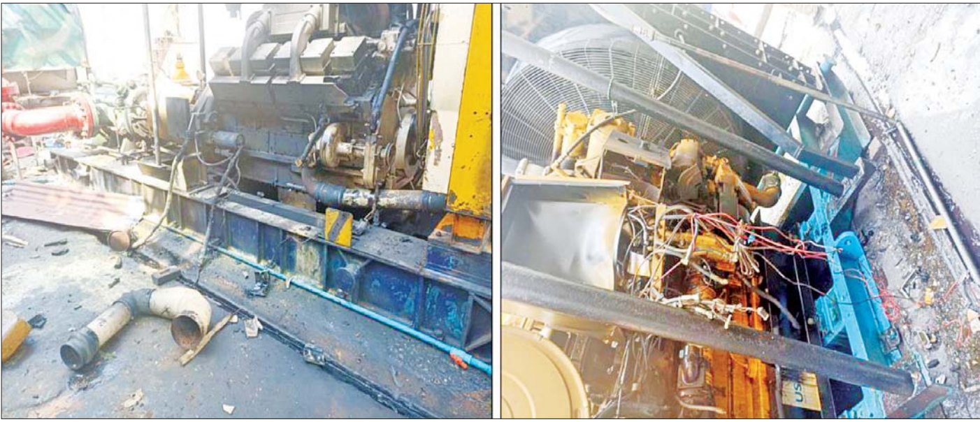
ပေါက်မြို့နယ်ရှိ မြန်မာ့ရေနံနှင့် သဘာဝဓာတ်ငွေ့လုပ်ငန်းပိုင် ရေမောင်းနှင့်ပေးပို့သည့် ပန်စက်ရုံအား အကြမ်းဖက်သမားများက မိုင်းခွဲတိုက်ခိုက်ခဲ့သည့် မှတ်တမ်းဓာတ်ပုံ။

နေပြည်တော် ဧပြီ ၁၀ မကွေးတိုင်းဒေသကြီး ပေါက်မြို့နယ် သမားတော်ကျေးရွာအနောက်ဘက်ရှိ မြန်မာ့ရေနံနှင့် သဘာဝဓာတ်ငွေ့လုပ်ငန်းပိုင် လက်ပံတိုက်နှင့် သာကြီးတောင် ရေနံမြေတို့သို့ ရေမောင်းနှင့်ပေးပို့သည့် ပန်စက်ရုံအား ဧပြီ ၉ ရက် နံနက်ပိုင်းက PDF အမည်ခံ အကြမ်းဖက်သမားများက လက်လုပ်မိုင်းဖြင့် ဖောက်ခွဲဖျက်ဆီးခဲ့ကြောင်း သိရသည်။ ဖြစ်စဉ်မှာ ဧပြီ ၉ ရက် နံနက် ၉ နာရီ မိနစ် ၂၀ တွင် ပေါက်မြို့နယ် သမားတော်ကျေးရွာ၏ အနောက်ဘက် နှစ်ဖာလှဲခန့်အကွာရှိ မြန်မာ့ရေနံနှင့် သဘာဝဓာတ်ငွေ့လုပ်ငန်းပိုင် လက်ပံတိုက်နှင့် သာကြီးတောင် ရေနံမြေတို့သို့ ရေမောင်းနှင့်ပေးပို့သည့် ပန်စက်ရုံအား PDF အမည်ခံ အကြမ်းဖက်သမားများက လက်လုပ်မိုင်းဖြင့် ဖောက်ခွဲဖျက်ဆီးခဲ့ကြောင်း သတင်းအရ လုံခြုံရေးတပ်ဖွဲ့ဝင်များက သွားရောက် စာမျက်နှာ ၁၁ ကော်လံ ၅ *