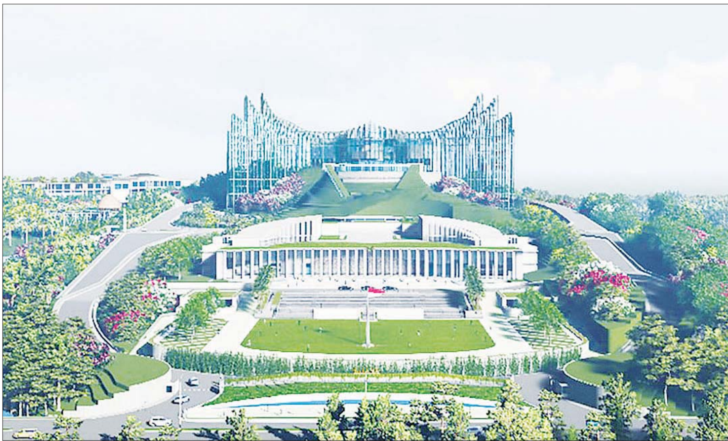
နုဆန်တရားမြို့သစ်မှာ တည်ဆောက်မယ့် အနာဂတ် သမ္မတနန်းတော်ကို ကွန်ပျူတာဖြင့် ပုံရိပ်ဖော်ထားသည်ကို တွေ့ရစဉ်။

ပြည်ပနိုင်ငံအသီးသီးမှာရှိတဲ့ ရင်းနှီး မြှုပ်နှံသူတွေကို စီးပွားရေးစင်တာများ