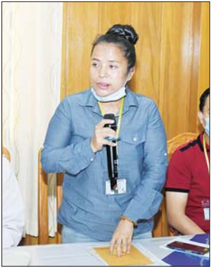
ကော်ဖီ လုပ်ငန်းရှင် တစ်ဦး တင်ပြစဉ်။

ကြောင်း၊ ယခင်က ဥရောပနိုင်ငံများတွင်သာ ကော်ဖီ စိုက်ပျိုးမှုနှင့် သောက်သုံးမှု များပြားခဲ့သော်လည်း လက်ရှိအချိန်တွင် အာရှနိုင်ငံများ၌လည်း အဓိက ထား စိုက်ပျိုးသောက်သုံးလာကြသည်ကိုတွေ့ရှိရ ကြောင်း၊ ပြင်ဦးလွင်ကော်ဖီသည် ယခင်ကတည်း ကပင် အနံ့အရသာနှင့် ပြည့်စုံပြီး နာမည်ရရှိပြီးဖြစ် သည့် ကော်ဖီမျိုးအစား တစ်ခုဖြစ်ကြောင်း၊ ကော်ဖီ စိုက်ပျိုးရာတွင် အရိပ်ရနှင့် အရိပ်မဲ့ စိုက်ပျိုးမှုဟူ၍ ရှိပြီး မိမိတို့နိုင်ငံ၌ ရာသီဥတုပြောင်းလဲလာမှုကို ထိန်းသိမ်းနိုင်ရန်နှင့် သစ်တောသစ်ပင် စိမ်းလန်းစေ ရေးအတွက် ရည်ရွယ်၍ အရိပ်ရ ကော်ဖီစိုက်ပျိုးရန် ပြင်ဦးလွင်မြို့နယ်၌ စီမံကိန်းအကောင်အထည်ဖော် ဆောင်ရွက်ပေးခဲ့ခြင်းဖြစ်ကြောင်း။