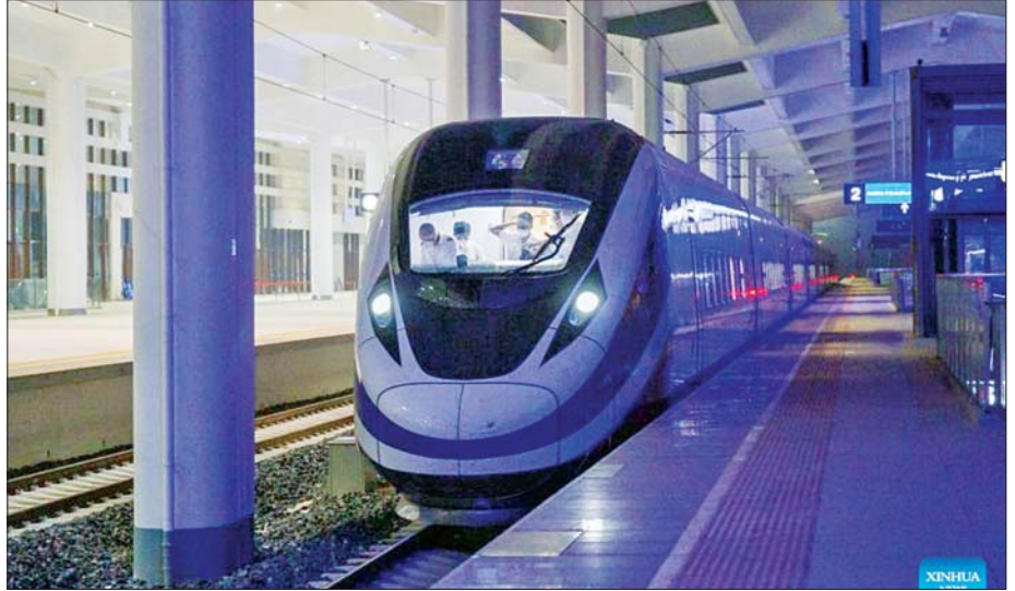
ဧပြီ ၉ ရက်က တတိယမြောက် လန်ချန်းရထား ဗီယင်ကျန်းဘူတာသို့ ဆိုက်ရောက်လာစဉ်။

၁၄ ရက်မှ ၁၆ ရက်အထိ ကျင်းပသွားမည်ဖြစ်ကြောင်း သိရသည်။ အဆိုပါပွဲတော်သည် လာအိုနိုင်ငံအတွက် ထင်ရှားသည့် ရိုးရာပွဲတော်တစ်ခုဖြစ်သည်။ ခရီးသွားများ သွားလာရေး အဆင်ပြေစေရန် EMU ရထားသစ်တွင် အဆင့်မြင့် အပိုတစ်တွဲနှင့် ပထမတန်း တစ်တွဲအပိုပါရှိသည်။ ယခင် EMU ရထားနှစ်စင်းနှင့် နှိုင်းယှဉ်ကြည့်မည်ဆိုပါက ယခု ရထားသစ်၌ ခရီးသည်တင်သည့်အတွက် ကွဲပြား ကြောင်း၊ အတွင်းပိုင်းအလှဆင်မှုကိုလည်း အဆင့် မြင့်ထားကြောင်း တရုတ် - လာအို ရထားလမ်း ကုမ္ပဏီက ပြောသည်။ ဧပြီ ၇ ရက်မှစတင်ပြီး လာအိုလမ်းပိုင်းအနေဖြင့် EMU ရထားခရီးစဉ် စုစုပေါင်း ၄၅၆ ခု ပြေးဆွဲခဲ့ပြီး ခရီးသည် ၂၃၆၈၀၀ ကို ပို့ဆောင်ပေးခဲ့ကြောင်း သိရ သည်။