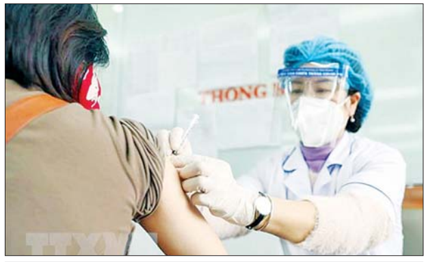
ဗီယက်နမ်နိုင်ငံ၌ ကျန်းမာရေးဝန်ထမ်းတစ်ဦးက ကိုဗစ်-၁၉ ကာကွယ်ဆေး ထိုးနှံပေးနေသည်ကို တွေ့ရစဉ်။

ဖြစ်ကြောင်း ကျန်းမာရေးဝန်ကြီးဌာန၏ ဖော်ပြချက်အရ သိရသည်။ ဗီယက်နမ်နိုင်ငံသည် ကိုဗစ်-၁၉ ကူးစက်ခံရခြင်းအတိုင်းအတာ မြင့်တက်လာမှုနှင့်အတူ ကိုဗစ်-၁၉ လှိုင်း လေးကြိမ်ကို ရင်ဆိုင် ကြုံတွေ့ခဲ့သည်။ ဗီယက်နမ်နိုင်ငံ၌ ကိုဗစ်-၁၉ စတင်ဖြစ်ပွားသည့် ၂၀၂၁ ခုနှစ် ဧပြီလအတွင်းမှ လက်ရှိ ဧပြီ ၁၀ ရက်အထိ ဒေသတွင်း ကူးစက်ခံရသူ ၁၀ ဒသမ ၂ သန်း နီးပါးရှိပြီဖြစ်ကြောင်း ကျန်းမာရေး ဝန်ကြီး ဌာနက ပြောကြားသည်။