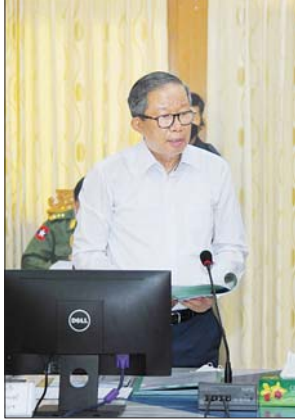
ပြည်ထောင်စု ဝန်ကြီး ဦးတင်ထွန်းဦး ရှင်းလင်း တင်ပြစဉ်။

နိုင်ခဲ့ခြင်းမရှိသည့်အတွက် ကော်ဖီလုပ်ငန်းရှင်များ ထိခိုက်နစ်နာခဲ့ရသည့် အခြေအနေများ၊ မြန်မာနိုင်ငံ ကော်ဖီလုပ်ငန်းရှင်များအသင်းကို ဖွဲ့စည်း၍ နိုင်ငံ တကာ ကော်ဖီဈေးကွက်ကို ထိုးဖောက်နိုင်ရေး ဆောင်ရွက်ခဲ့ပြီး လက်ရှိတွင် ကော်ဖီသည် အလား အလာကောင်းသည့် ဈေးကွက်ရရှိလာပြီဖြစ်သည့် အခြေအနေများ၊ ကော်ဖီလုပ်ငန်း အောင်မြင်စွာ ဖြစ်ပေါ်လာရေး၊ မြန်မာ့ကော်ဖီကို ကမ္ဘာ့ဈေးကွက်သို့ ထိုးဖောက်နိုင်ရေးအတွက် အစိုးရအဖွဲ့မှ တာဝန်ရှိသူ များက ဦးဆောင်လုပ်ငန်းရှင်များအားလုံး ကြိုးပမ်း ဆောင်ရွက်ရန်လိုသည့် အခြေအနေများ၊ အစိုးရမှ ခွင့်ပြုပေးထားသည့် စိုက်ပျိုးမြေ ဧရိယာများအတွင်း တရားမဲ့ဝင်ရောက်နေထိုင်ခြင်း၊ ရာသီသီးနှံများ စိုက်ပျိုးခြင်းတို့ကြောင့် ကော်ဖီလုပ်ငန်းရှင်များ၏ ထိခိုက်နစ်နာနေမှုများကို ဖြေရှင်းဆောင်ရွက်ပေး စေလိုသည့် အခြေအနေများကိုတင်ပြကြပြီး မန္တလေး တိုင်းဒေသကြီးဝန်ကြီးချုပ် ဦးမောင်ကိုက တိုင်းဒေသကြီး အစိုးရအဖွဲ့အနေဖြင့် ကော်ဖီလုပ်ငန်း အောင်မြင်စေရေး လုပ်ငန်းရှင်များနှင့် တွေ့ဆုံ ဆောင်ရွက်ခဲ့သည့် အခြေအနေများနှင့်ပတ်သက်၍ ဖြည့်စွက်ရှင်းလင်းတင်ပြသည်။