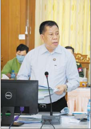
တိုင်းဒေသကြီး ဝန်ကြီးချုပ် ဦးမောင်ကို ရှင်းလင်း တင်ပြစဉ်။

များကို ဖြန့်ဖြူးပေးလျက်ရှိသည့် အခြေအနေများကို ရှင်းလင်းတင်ပြကြသည်။ လုပ်ငန်းဆောင်ရွက်မှုအခြေအနေများနှင့် လိုအပ်သည်များကို အစိုးရမှ ဦးဆောင် ဆောင်ရွက်ပေးနိုင်ရေး တင်ပြဆွေးနွေး ယင်းနောက် တက်ရောက်လာကြသည့် ကော်ဖီ လုပ်ငန်းရှင်များက ကော်ဖီစိုက်ပျိုးရေးစီမံကိန်းကို ဖော်ဆောင်ရာတွင် အစိုးရတာဝန်ရှိသူများ၊ သက်ဆိုင် ရာ ဝန်ကြီးဌာနများမှ တာဝန်ရှိသူများ၊ ကော်ဖီ လုပ်ငန်းရှင်များအားလုံး ညီညွတ်ညွတ်ဖြင့် လုပ်ငန်းအောင်မြင်အောင် ဝိုင်းဝန်းဆောင်ရွက်ရန် လိုအပ်သည့် အခြေအနေများ၊ ကော်ဖီစီမံကိန်းများ စတင်ဆောင်ရွက်ပေးခဲ့သည့် လုပ်ငန်းအောင်မြင်စွာ ဆောင်ရွက်နိုင်ခဲ့သော်လည်း နောက်ပိုင်းတွင် မြန်မာ့ ဈေးကွက်နှင့် ကမ္ဘာ့ဈေးကွက် ချိတ်ဆက်ဆောင်ရွက်