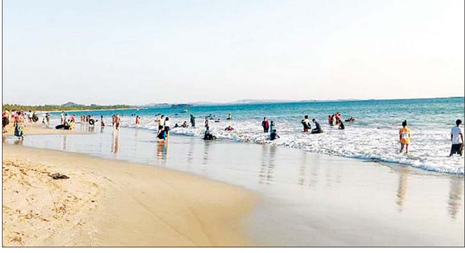
ဧရာဝတီတိုင်းဒေသကြီး ပုသိမ်ခရိုင် ငွေဆောင်ကမ်းခြေတွင် နှစ်သစ်ကူးရုံးပိတ်ရက် ကာလအတွင်း လာရောက်အပန်းဖြေကြသည့် ခရီးသွားဧည့်သည်များဖြင့် စည်ကားနေသည်ကို တွေ့ရစဉ်။