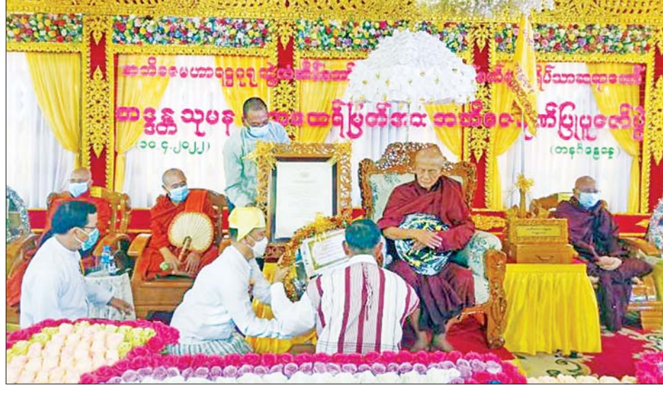
နိုင်ငံတော်စီမံအုပ်ချုပ်ရေးကောင်စီဝင် မန်းငြိမ်းမောင် ဆရာတော် ဘဒ္ဒန္တသုမန အား အဘိဓမ္မဟာရဋ္ဌဂုရု ဘွဲ့တံဆိပ်တော် ဆက်ကပ်ပူဇော်စဉ်။

ထပ်ဆင့်ဆက်ကပ် ပူဇော်သည်။ ဝါးခယ်မမြို့နယ် သံကုန်း/ကြာဖြူ ကျေးရွာ၌ ပြုလုပ်သည့် သုံးသီးဝင်းက ဆရာတော် သံဃာတော် များအား လှူဖွယ်ဝတ္ထုများ ဆက်ကပ်လှူဒါန်းသည်။ ဆက်လက်၍ ဧည့်ပရိသတ် များက မော်လမြိုင်ကျွန်း မြို့နယ် သံဃနာယကအဖွဲ့ဥက္ကဋ္ဌ ဆရာတော် ဘဒ္ဒန္တဇောတိက ထံမှ ရေစက်ချတရားနာယူကြပြီး ဗုဒ္ဓသာသနံ စိရတိဋ္ဌတု သုံးကြိမ် ရွတ်ဆို၍ အခမ်းအနား ရုပ်သိမ်းလိုက်ကြောင်း သိရသည်။ မွန်းလုံပိုင်းတွင် နိုင်ငံတော်စီမံအုပ်ချုပ်ရေး ကောင်စီဝင် မန်းငြိမ်းမောင်သည် ဧရာဝတီ