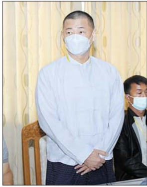
ကော်ဖီ လုပ်ငန်းရှင် တစ်ဦး တင်ပြစဉ်။

ကော်ဖီစီမံကိန်းကို စိုက်ပျိုးရေး၊ မွေးမြူရေးနှင့် ဆည်မြောင်းဝန်ကြီးဌာနက တာဝန်ယူ၍အောင်မြင် မှုရှိအောင် ကိုင်တွယ်ဆောင်ရွက်ရန် လိုအပ်ကြောင်း၊ ဦးစီးဌာနများအနေဖြင့် လုပ်ငန်းများ တစ်ခုနှင့်တစ်ခု ဆက်စပ်၍ မူဝါဒ များ ချမှတ်အကောင်အထည်ဖော် ခြင်း၊ ကြီးကြပ်ကွပ်ကဲခြင်းများကို ဆောင်ရွက်ရ သည်ဖြစ်သဖြင့် ရုံးလုပ်ငန်းဆိုင်ရာများကို စနစ်တကျ