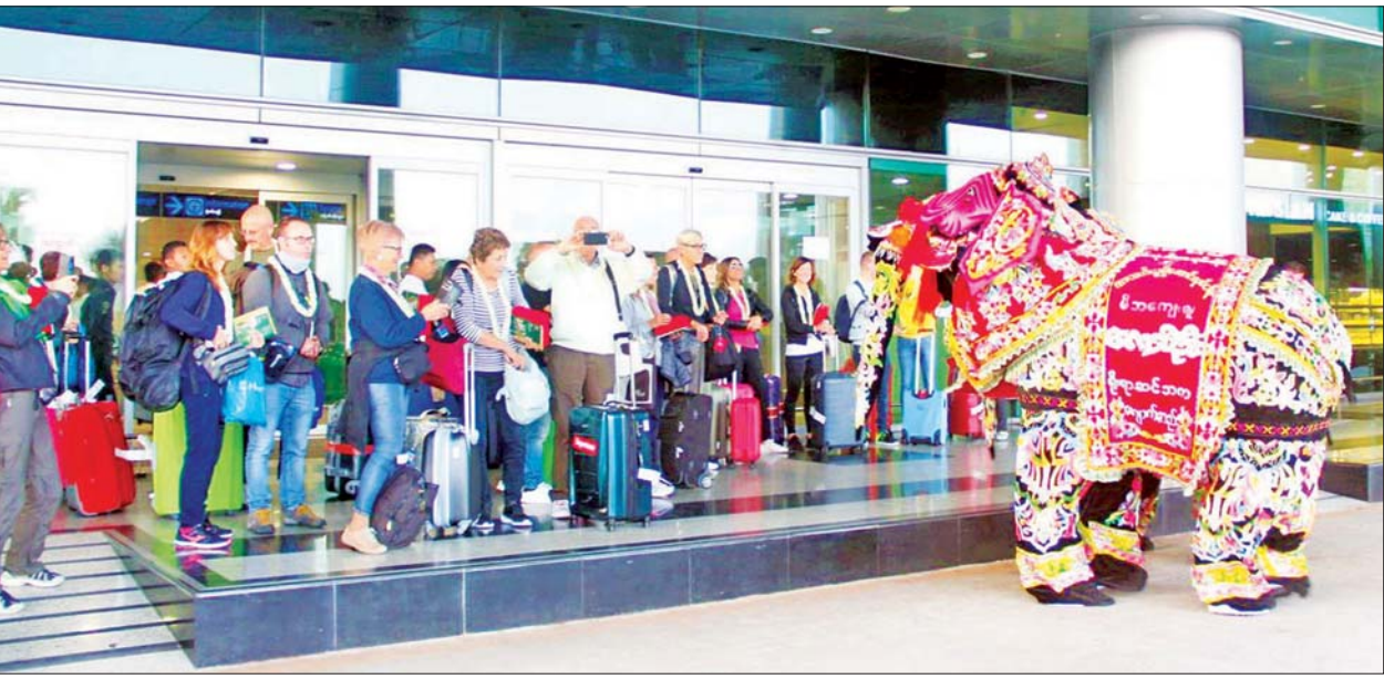
ကိုဗစ်-၁၉ မတိုင်မီကာလက နိုင်ငံတကာခရီးသွားများကို ရန်ကုန်အပြည်ပြည်ဆိုင်ရာလေဆိပ်မှ နွေးထွေးစွာ ကြိုဆိုခဲ့စဉ်။