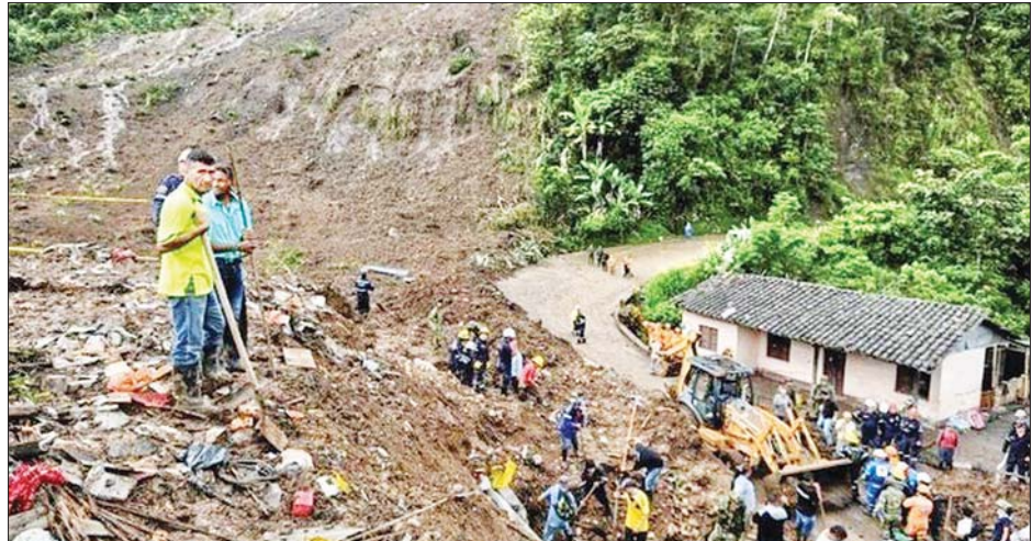
ကိုလံဘီယာအနောက်မြောက်ပိုင်း မြို့တစ်မြို့ဖြစ်သည့် လာအန်တီဝါတွင် မြေပြိုကျနေသည်ကို တွေ့ရစဉ်။