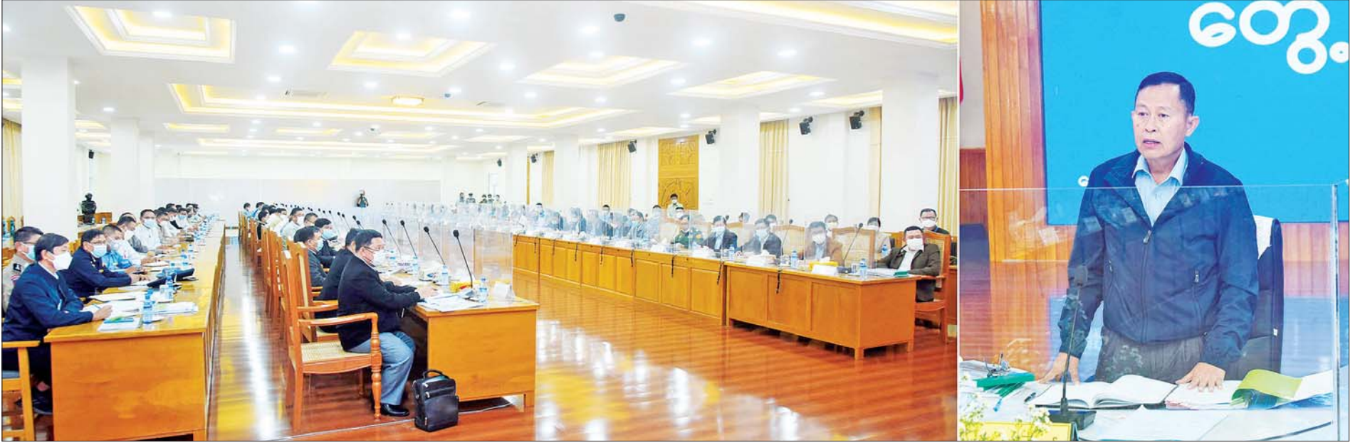
နိုင်ငံတော်စီမံအုပ်ချုပ်ရေးကောင်စီ ဒုတိယဥက္ကဋ္ဌ ဒုတိယတပ်မတော်ကာကွယ်ရေးဦးစီးချုပ် ကာကွယ်ရေးဦးစီးချုပ်(ကြည်း) ဒုတိယဗိုလ်ချုပ်မှူးကြီး စိုးဝင်း ရှမ်းပြည်နယ်အစိုးရအဖွဲ့ဝင်များနှင့် ပြည်နယ်အဆင့် ဌာနဆိုင်ရာများအား တွေ့ဆုံအမှာစကားပြောကြားစဉ်။