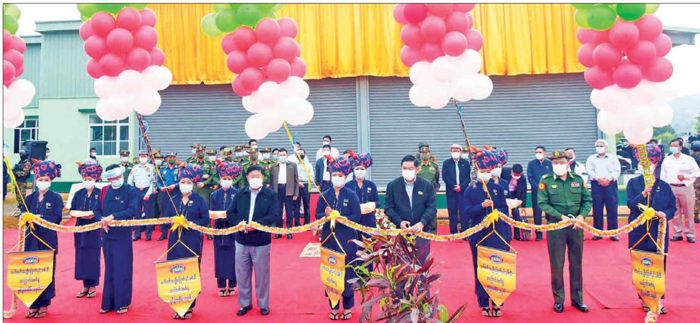
ရှမ်းပြည်နယ်ဝန်ကြီးချုပ် ဒေါက်တာကျော်ထွန်း၊ မြန်မာစီးပွားရေးကော်ပိုရေးရှင်းဥက္ကဋ္ဌ ဒုတိယဗိုလ်ချုပ်ကြီး ညိုစော၊ အရှေ့ပိုင်းတိုင်းစစ်ဌာနချုပ် တိုင်းမှူးဗိုလ်ချုပ်နီလင်းအောင်နှင့် ပအိုဝ်းကိုယ်ပိုင်အုပ်ချုပ်ခွင့်ရဒေသဥက္ကဋ္ဌ ဦးခွန်ရဲထွေးတို့က လက်ဖက်အချိုခြောက်နှင့် သစ်သီးအခြောက်ခဲစက်ရုံ(နောင်တရား)အား ဖွဲ့စည်းဖြတ်ဖွင့်လှစ်ပေးစဉ်။

ဖြစ်ကြောင်း။ ရေရှည်ရပ်တည်နိုင်ရေး ထိန်းသိမ်းလက်ဖက်ရွက်စိမ်းများနှင့် ဒေသထွက် သစ်သီးဝလံများ ဈေးကွက်ခိုင်မာရှင်သန်လာသည်နှင့် စိုက်ပျိုးရေးလုပ်ငန်းများ တိုးတက်ဖွံ့ဖြိုးလာပြီး ပအိုဝ်းဒေသတွင် အစားထိုးလက်ဖက်သီးနှံအဖြစ် တိုးချဲ့စိုက်ပျိုးနိုင်ခြင်း၊ ဒေသအတွင်းအလုပ်အကိုင်အခွင့်အလမ်းများ ပိုမိုတိုးတက်ရရှိလာခြင်းနှင့် တောင်သူများ၏ လူမှုစီးပွားဘဝ ပိုမိုဖွံ့ဖြိုးတိုးတက်ကောင်းမွန်လာနိုင်ခြင်းစသော အကျိုးကျေးဇူးများမှ တစ်ဆင့် နိုင်ငံသာယာဝပြောရေး၊ စားရေရရှိကွာဟမှုမှ ပိုလျှံအောင်ဆောင်ရွက်ပေးရေး၊ စားရေရရှိကွာဟမှုမှ ပိုလျှံအောင်ဆောင်ရွက်ပေးရေးနှင့် ဒေသတွင်း ဖွံ့ဖြိုးတိုးတက်မှုကို အထောက်အကူပြုမည်ဖြစ်သည့်အတွက် လက်ဖက်အချိုခြောက်နှင့် သစ်သီးအခြောက်ခဲစက်ရုံ (နောင်တရား)အား ရင်းနှီးမြှုပ်နှံမှုပမာဏများစွာဖြင့် တည်ဆောက်ပေးခဲ့ခြင်းဖြစ်ကြောင်း၊ ယခုဖွင့်လှစ်လိုက်သည့် လက်ဖက်ခြောက်နှင့် သစ်သီးအခြောက်ခဲစက်ရုံ(နောင်တရား)သည် နောင်တရားမြို့အပါအဝင် ပအိုဝ်းကိုယ်ပိုင်အုပ်ချုပ်ခွင့်ရ ဒေသအတွက် အဆင့်အတန်းမြင့်မား၍ ဂုဏ်ယူဖွယ်ကောင်း