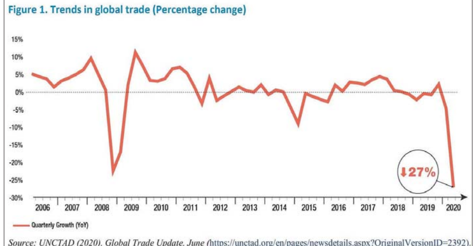
ကိုဗစ်-၁၉ ကြောင့် ကမ္ဘာလုံးဆိုင်ရာ ကုန်စည်ပို့ဆောင်မှု လျော့ကျခဲ့သည့် အနေအထားပြဂရပ်

ဒါကြောင့် နိုင်ငံတကာ ကုန်စည်ပို့ဆောင်မှုတွေဟာ နယ်စပ်ဖြတ်ကျော် ကုန်စည်သယ်ဆောင်မှုတွေကိုလည်း စာမျက်နှာ ၁၉ သို့