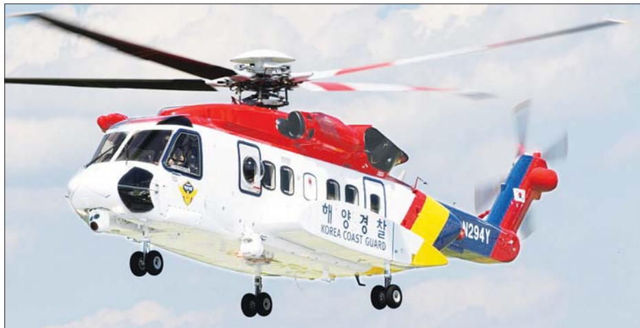
တောင်ကိုရီးယားနိုင်ငံ ကမ်းခြေစောင့်ရဟတ်ယာဉ်တစ်စင်းကို တွေ့ရစဉ်။