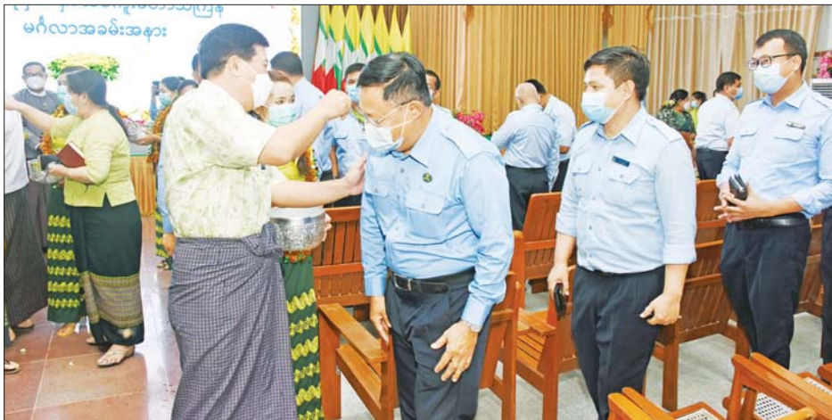
နိုင်ငံအကျိုး၊ မိမိတို့ဝန်ကြီးဌာနအကျိုးအတွက် ဆက်လက်၍ ဒုတိယဝန်ကြီး ဦးညွန့်အောင်က နှစ်သစ်ဆုတောင်းစကားပြောကြားပြီး ဝန်ထမ်းများ အား သပြေခက်နှင့် အတာရေပက်ဖျန်းကာ

အခမ်းအနားတွင် ပြည်ထောင်စုဝန်ကြီး ဒေါက်တာပွင့်ဆန်းက နှစ်သစ်ကူးကြိုဆို နှုတ်ခွန်း ဆက်စကားပြောကြားရာတွင် တစ်နှစ်တာကာလ ပတ်လုံး အခက်အခဲများအကြားမှ ဝန်ကြီးဌာန၏ လုပ်ငန်းတာဝန်များကို ကျေပွန်စွာထမ်းဆောင်ခဲ့ကြ သည့် အရာထမ်း၊ အမှုထမ်းများအားလုံးကို ကျေးဇူး တင်ရှိကြောင်း၊ သင်္ကြန်ပိတ်ရက်ကာလအတွင်း မိသားစုများနှင့် အေးချမ်းပျော်ရွှင်စွာ အနားယူ အပန်းဖြေပြီး နှစ်သစ်တွင် ကျန်းမာပျော်ရွှင်စွာဖြင့်