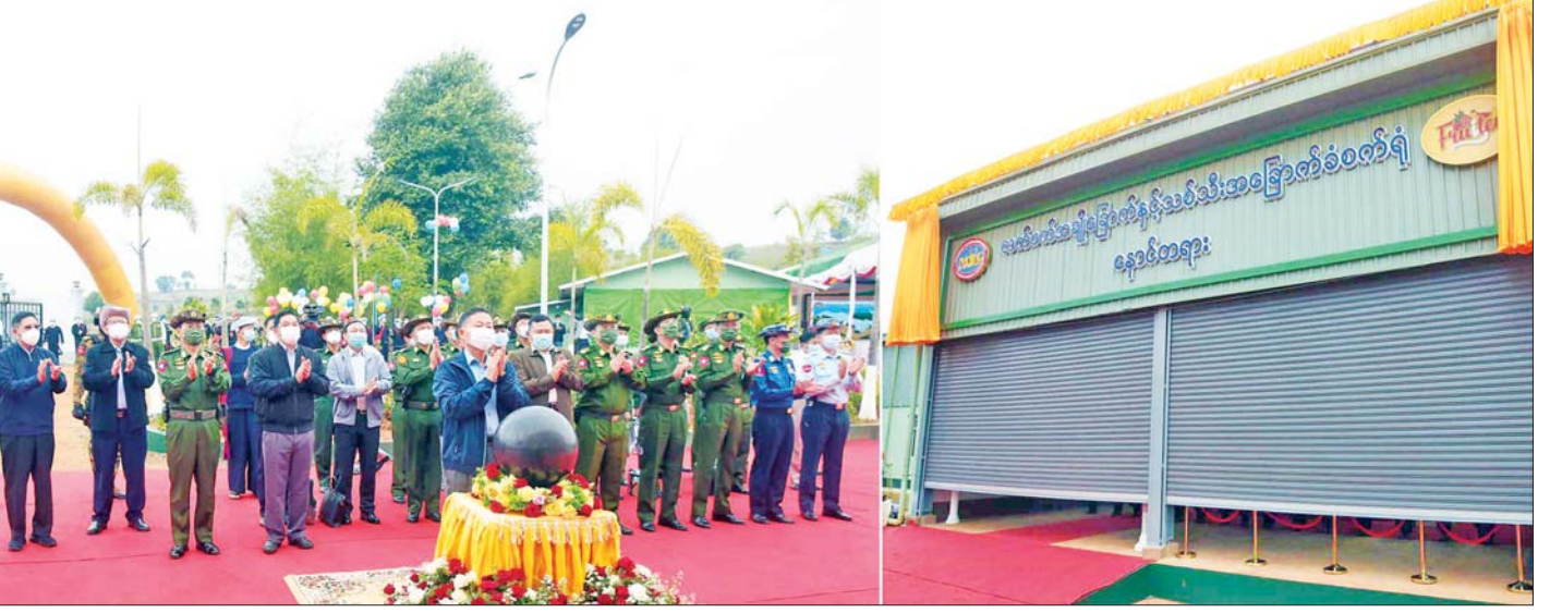
နိုင်ငံတော်စီမံအုပ်ချုပ်ရေးကောင်စီဒုတိယဥက္ကဋ္ဌ ဒုတိယတပ်မတော်ကာကွယ်ရေးဦးစီးချုပ် ကာကွယ်ရေးဦးစီးချုပ်(ကြည်း) ဒုတိယဗိုလ်ချုပ်မှူးကြီး စိုးဝင်း လက်ဖက်အချိုခြောက်နှင့် သစ်သီးအခြောက်ခံစက်ရုံ(နောင်တရား) ဆိုင်းဘုတ်အား စက်ခလုတ်နှိပ်ဖွင့်လှစ်ပေးစဉ်။

၂၀၀ ခန့်က စတင်စိုက်ပျိုးခဲ့ကြပြီး အသက်မွေးဝမ်းကျောင်းအတွက် အဓိကကျသော လုပ်ငန်းတစ်ရပ်အနေဖြင့်မဟုတ်ဘဲ ဖြည့်စွက်သီးနှံအနေဖြင့် စိုက်ပျိုးခဲ့ကြကြောင်း၊ အရွက်အညွန့်များ ခူးရာတွင် လည်း ထွက်ရှိသရွေ့ မခူးနိုင်ဘဲ ဝယ်လိုအားအရသာ ခူးဆွတ်၍ ရသည့်ဈေးဖြင့်သာ ရောင်းချခဲ့ရကြောင်း၊ နောင်တရားပတ်ဝန်းကျင် ကျေးရွာအုပ်စု ရှစ်စုတွင် လက်ရှိလက်ဖက်စိုက်ဧက စုစုပေါင်း ၄၅၆ ဧကခန့်နှင့် တစ်ဧကပျမ်းမျှ လက်ဖက်ရွက်စိမ်း ပိဿာ၆၀၀