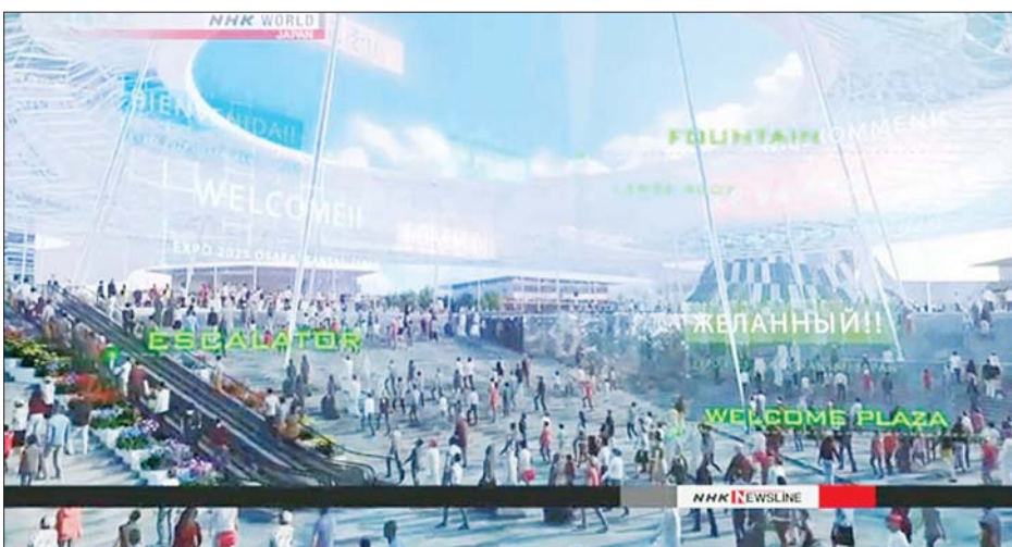
၂၀၂၅ ကမ္ဘာ့ကုန်စည်ပြပွဲသရုပ်ဖော်ပုံစံငယ်ကို တွေ့ရစဉ်။

ထို့အပြင် နိုင်ငံတကာ အဖွဲ့အစည်း ခုနစ်ခုလည်း ကမ္ဘာ့ကုန်စည်ပြပွဲသို့ ဝင်ရောက်ပြသရန် စီစဉ်ထားကြောင်း ဧပြီ ၈ ရက်တွင် ဝါကာမိယာက ထပ်လောင်းပြောကြားလိုက်သည်။