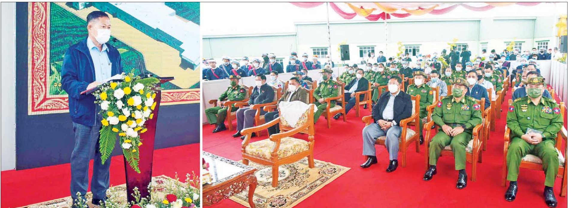
နိုင်ငံတော်စီမံအုပ်ချုပ်ရေးကောင်စီဒုတိယဥက္ကဋ္ဌ ဒုတိယတပ်မတော်ကာကွယ်ရေးဦးစီးချုပ် ကာကွယ်ရေးဦးစီးချုပ်(ကြည်း) ဒုတိယဗိုလ်ချုပ်မှူးကြီး စိုးဝင်း လက်ဖက်အချိုခြောက်နှင့် သစ်သီးအခြောက်ခံစက်ရုံ (နောင်တရား) ဖွင့်ပွဲအခမ်းအနားတွင် အမှာစကားပြောကြားစဉ်။