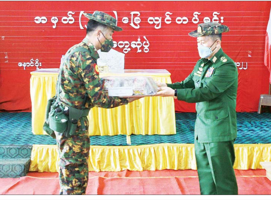
နိုင်ငံတော်စီမံအုပ်ချုပ်ရေးကောင်စီ ဒုတိယဥက္ကဋ္ဌ ဒုတိယတပ်မတော်ကာကွယ်ရေးဦးစီးချုပ် ကာကွယ်ရေး ဦးစီးချုပ်(ကြည်း) ဒုတိယဗိုလ်ချုပ်မှူးကြီး စိုးဝင်း နောင်တိုင်းတပ်နယ်ရှိ အရာရှိ၊ စစ်သည်၊ မိသားစုများ အတွက် စားသောက်ဖွယ်ရာနှင့်ထောက်ပံ့ငွေများ ပေးအပ်စဉ်။

တပ်မတော်သားများအနေဖြင့် နိုင်ငံတော်မှ ပေးအပ်သော လစာနှင့်ရိက္ခာကို ရရှိခံစားနေခြင်း ဖြစ်၍ သစ္စာအဓိဋ္ဌာန် (၄) ချက်ပါအတိုင်း နိုင်ငံတော် နှင့် နိုင်ငံသားတို့၏သစ္စာအပေါ် အလေးထား စောင့်ထိန်းရန်လိုကြောင်း၊ သစ္စာစောင့်သိမှုတွင် နှုတ်ဖြင့်သာ စောင့်ထိန်းရန်မဟုတ်ဘဲ လက်တွေ့အမှန် တာဝန်သိမှုဖြင့် စောင့်ထိန်းရန်လိုကြောင်း၊ ပေးအပ် သည့်တာဝန်ကို ကျေပွန်စွာ ထမ်းဆောင်ခြင်းသည် လည်း ကျေးဇူးတရားကို သိရှိခြင်းပင်ဖြစ်ကြောင်း၊ ပြည်ပနိုင်ငံကြီးအချို့နှင့် ပြည်တွင်းအကြမ်းဖက် အဖွဲ့များအနေဖြင့် နည်းမျိုးစုံသုံးကာ အစိုးရယန္တရား ရပ်တန့်စေရန် ကြိုးပမ်းခဲ့သော်လည်း ထင်တိုင်း မပေါက်သဖြင့် နိုင်ငံတော်၏အခိုင်မာဆုံးအင်အားစု