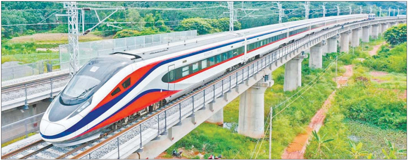
တရုတ်နိုင်ငံ ကုမင်းနှင့် လာအိုနိုင်ငံ ဗီယင်ကျန်းအကြား ပြေးဆွဲသည့် မြန်နှုန်းမြင့်ရထားကို တွေ့ရစဉ်။

ဘန်ကောက်မြို့ရဲ့ မြောက်ဘက် ကီလိုမီတာ ၇၀ လောက်အကွာဒေသမှာ Nippon Express Holdings Inc. ရဲ့ ဒေသရုံးခွဲမှာရှိတဲ့ ဝန်ထမ်းတွေဟာ ကမ္ဘာ့ဒီဒီယား၊ လာအိုနဲ့ ဗီယက်နမ်နိုင်ငံတို့ကို ကုန်ပစ္စည်းတွေ ပေးပို့နိုင်ဖို့ အလုပ်များနေကြပါတယ်။ ဒီနေရာကနေ နေ့စဉ် ထရပ်ကားအစီး ၃၀ ကနေ ၄၀ အကြား အဝင်အထွက်ရှိပါတယ်။ ဒီကုန်စည် အများအပြားရဲ့ ပိုင်ရှင်တွေက ဂျပန်နိုင်ငံ က ကုန်ပစ္စည်းထုတ်လုပ်သူတွေ ဖြစ်ကြပါတယ်။ ကုန်စည်ပို့ဆောင်ရေး ကုမ္ပဏီတစ်ခုဖြစ်တဲ့ Nippon Express Holdings Inc. ဟာ ၁၉၉၀ ပြည့်နှစ်တွေက စပြီး ကုန်းလမ်းကနေ နယ်စပ်ဖြတ်ကျော် ကုန်စည် သယ်ယူပို့ဆောင်မှု အလားအလာတွေအပေါ် သုတေသနပြု လေ့လာခဲ့ပါတယ်။ Nippon Express ကုမ္ပဏီတာဝန်ရှိသူတစ်ဦးက မကြာသေးမီကာလက စပြီး သူတို့ကုမ္ပဏီဟာ ကုန်ပစ္စည်းတွေ သယ်ယူ ပို့ဆောင်စဉ်မှာ တုန့်ခါမှုတွေ ဖြစ်ပေါ်လို့မရတဲ့ တိတိကျကျ တိုင်းထွာတဲ့ စက်ပစ္စည်းကိရိယာ (precision equipment) တွေ ကုန်းလမ်းခရီးကနေ သယ်ယူ ပို့ဆောင်ပေးဖို့ အမှာစာတွေ အများအပြား လက်ခံ ရရှိခဲ့ကြောင်း ပြောကြားခဲ့ပါတယ်။