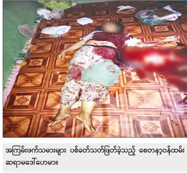
အကြမ်းဖက်သမားများ ပစ်ခတ်သတ်ဖြတ်ခဲ့သည့် စေတနာ့ဝန်ထမ်း ဆရာမဒေါ်ဟေမာ။