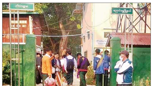
ညောင်ရွှေမြို့နယ်၌ ၂၀၂၁-၂၀၂၂ ခုနှစ် တက္ကသိုလ်ဝင်စာမေးပွဲ ပထဝီဝင်ဘာသာရပ်ကို ဧပြီ ၇ ရက်က ကျောင်းသား ကျောင်းသူ များ လာရောက်ဖြေဆိုကြစဉ်။