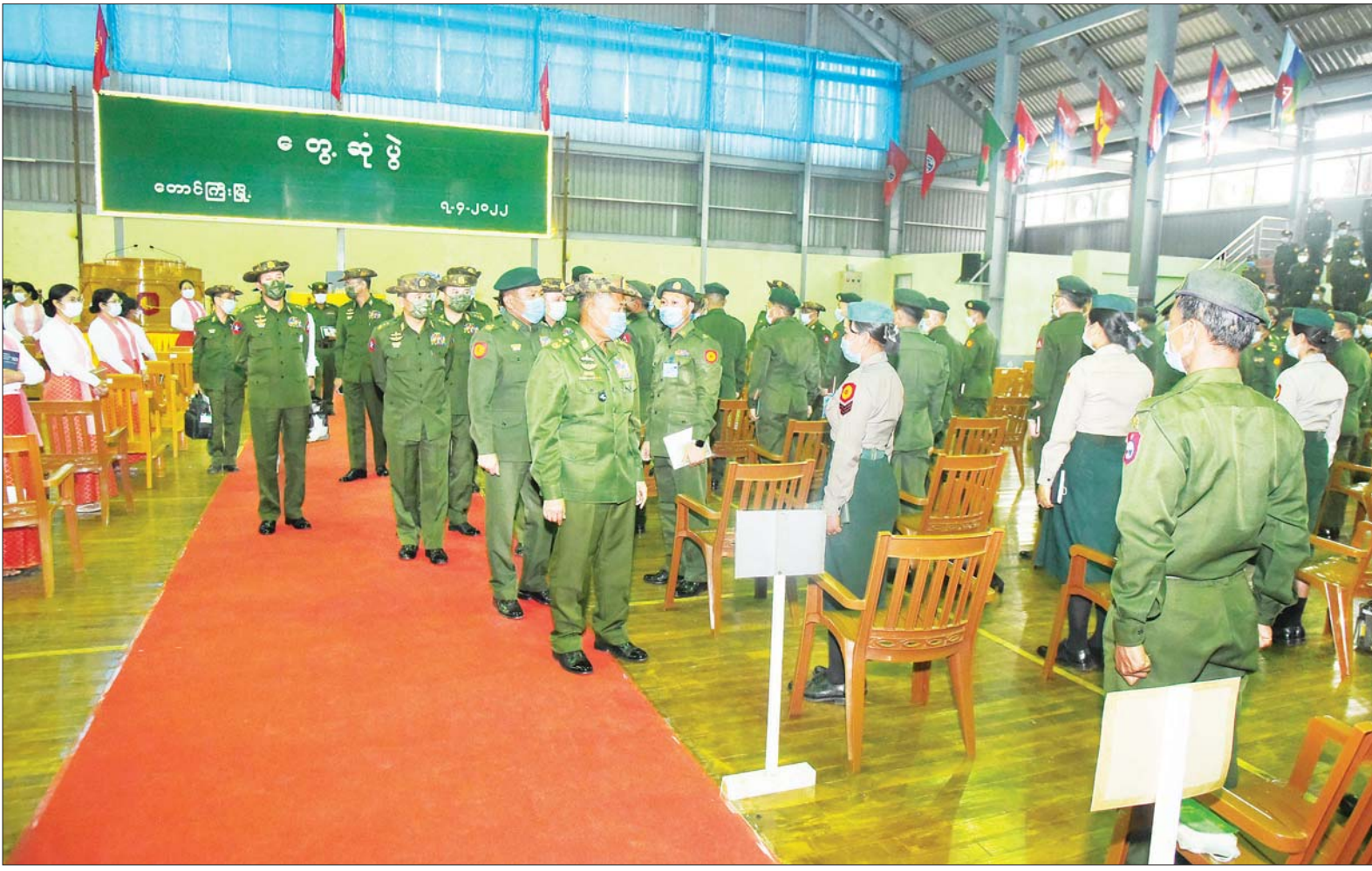
နိုင်ငံတော်စီမံအုပ်ချုပ်ရေးကောင်စီ ဒုတိယဥက္ကဋ္ဌ ဒုတိယတပ်မတော်ကာကွယ်ရေးဦးစီးချုပ် ကာကွယ်ရေးဦးစီးချုပ်(ကြည်း) ဒုတိယဗိုလ်ချုပ်မှူးကြီး စိုးဝင်း တောင်ကြီးတပ်နယ်ရှိ အရာရှိ၊ စစ်သည်၊ မိသားစုများအား ရင်းရင်းနှီးနှီး နှုတ်ဆက်စဉ်။

နေပြည်တော် ဧပြီ ၇ နိုင်ငံတော် စီမံအုပ်ချုပ်ရေးကောင်စီ ဒုတိယဥက္ကဋ္ဌ ဒုတိယတပ်မတော်ကာကွယ်ရေးဦးစီးချုပ် ကာကွယ်ရေး ဦးစီးချုပ်(ကြည်း) ဒုတိယဗိုလ်ချုပ်မှူးကြီး စိုးဝင်းသည် ကာကွယ်ရေးဦးစီးချုပ်ရုံး(ကြည်း)မှ ဒုတိယဗိုလ်ချုပ်ကြီးအောင်ဇော်အေး၊ ကာကွယ်ရေးဦးစီးချုပ်ရုံး(ကြည်း)၊ ရေ၊ လေ)မှ တပ်မတော် အရာရှိကြီးများ လိုက်ပါ၍ ယနေ့နံနက်ပိုင်းတွင် နောင်ဝိုင်း၊ ကျိုင်းခမ်း၊ မိုင်းပျဉ်းနှင့် တောင်ကြီးတပ်နယ်တို့ရှိ နယ်မြေခံတပ်များသို့ သွားရောက်၍ အရာရှိ၊ စစ်သည်၊ မိသားစုများအား သီးခြားစီ တွေ့ဆုံအမှာစကား ပြောကြားသည်။ တွေ့ဆုံပွဲများတွင် နိုင်ငံတော်စီမံအုပ်ချုပ်ရေးကောင်စီ ဒုတိယဥက္ကဋ္ဌ ဒုတိယတပ်မတော်ကာကွယ်ရေး ဦးစီးချုပ်(ကြည်း) ဒုတိယဗိုလ်ချုပ်မှူးကြီး စိုးဝင်းက အမှာစကား ပြောကြားရာတွင် စာမျက်နှာ ၃ ကော်လံ ၁