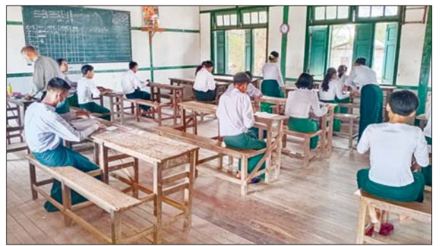
စစ်ကိုင်းတိုင်းဒေသကြီး ကန့်ဘလူမြို့နယ်၌ ၂၀၂၁-၂၀၂၂ ခုနှစ် တက္ကသိုလ်ဝင်စာမေးပွဲ ပထဝီဝင်ဘာသာရပ်ကို ဧပြီ ၇ ရက်က ကျောင်းသား ကျောင်းသူများ ဖြေဆိုနေသည်ကို တွေ့ရစဉ်။