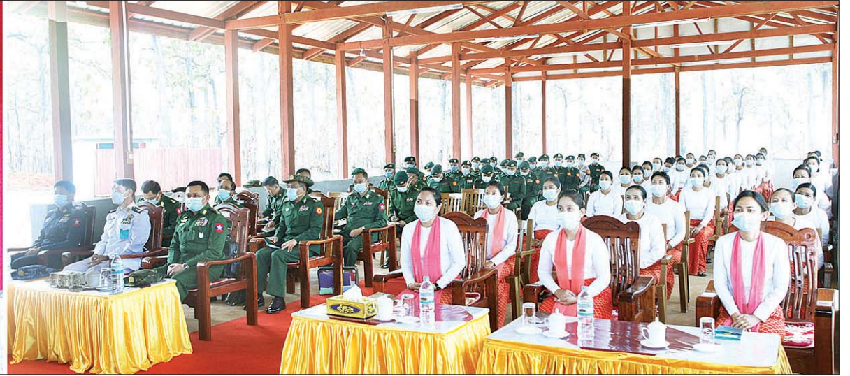
နိုင်ငံတော်စီမံအုပ်ချုပ်ရေးကောင်စီ ဒုတိယဥက္ကဋ္ဌ ဒုတိယတပ်မတော်ကာကွယ်ရေးဦးစီးချုပ် ကာကွယ်ရေးဦးစီးချုပ်(ကြည်း) ဒုတိယဗိုလ်ချုပ်မှူးကြီး စိုးဝင်း ကျိုင်းခမ်းတပ်နယ်၌ အရာရှိ၊ စစ်သည်၊ မိသားစုဝင်များအား တွေ့ဆုံအမှာစကားပြောကြားစဉ်။