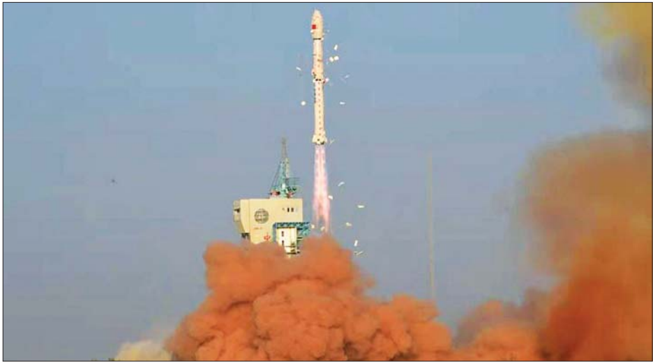
တရုတ်နိုင်ငံ အနောက်မြောက်ပိုင်း ကျိချမ်ဂြိုဟ်တုလွှတ်တင်ရေးစင်တာမှ Gaofen-3 03 ဂြိုဟ်တုအား လောင်းမှာချိ-၄ စီ ခုံးပျံကို အသုံးပြု၍ လွှတ်တင်နေသည်ကို တွေ့ရစဉ်။

လျော့ပါးသက်သာရေး၊ ပြောင်းလဲနေသော အတ္ထဝါ သဘာဝပတ်ဝန်းကျင် စောင့်ကြည့်ရေး၊ အတ္ထဝါ သုတေသန၊ သဘာဝပတ်ဝန်းကျင်ကာကွယ်ရေး၊ ရေထိန်းသိမ်းရေး၊ စိုက်ပျိုးရေးနှင့် မိုးလေဝသ စောင့်ကြည့်ရေးတို့တွင် အဆိုပါ ဂြိုဟ်တုကို အသုံးပြု သွားမည်ဖြစ်ကြောင်း သိရသည်။ ထို့အပြင် ပင်လယ် ရေကြောင်းဆိုင်ရာ အခွင့်အရေးများနှင့် အကျိုးစီးပွား များကို ကာကွယ်ရန်အတွက်လည်း အဆိုပါ ဂြိုဟ်တု ကို အသုံးပြုသွားမည်ဖြစ်ကြောင်း သိရသည်။ အဆိုပါဂြိုဟ်တုလွှတ်တင်မှုသည် လောင်းမှာချိ သယ်ဆောင်ရေးခုံးပျံများ၏ (၄၁၄) ကြိမ်မြောက် လွှတ်တင်မှုဖြစ်ကြောင်း သိရသည်။ ဆင်ဟွာ