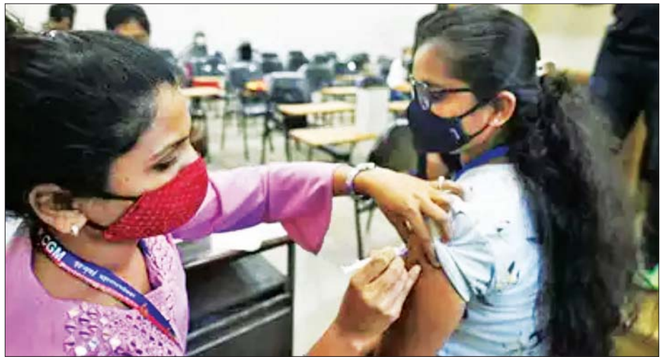
အိန္ဒိယနိုင်ငံ၌ ကိုဗစ်-၁၉ ရောဂါ ကာကွယ်ဆေးထိုးနှံပေးနေသည်ကို တွေ့ရစဉ်။