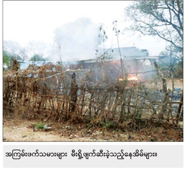
အကြမ်းဖက်သမားများ မီးရှို့ဖျက်ဆီးခဲ့သည့်နေအိမ်များ။