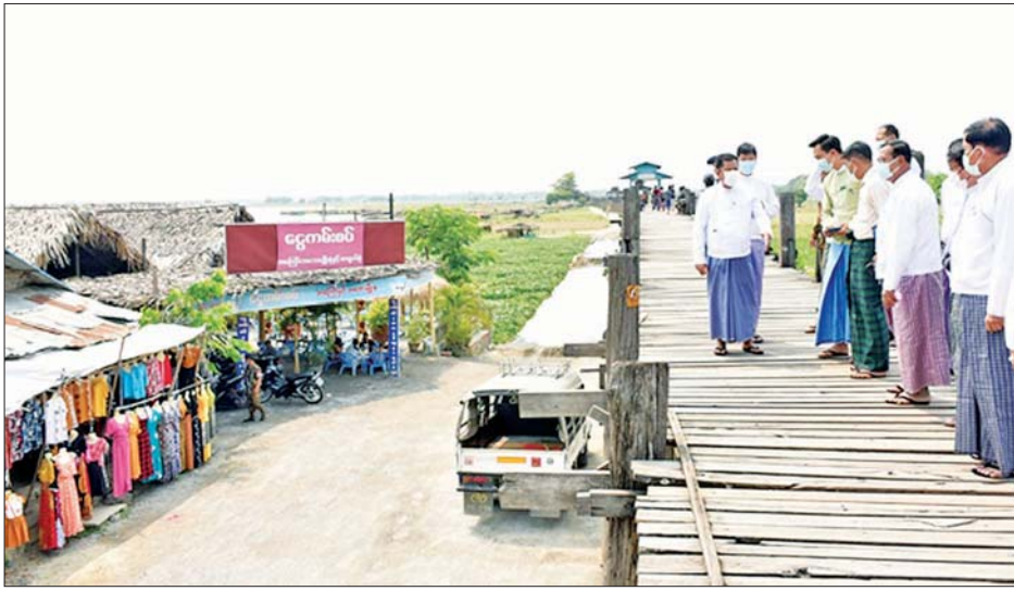
နှင့် သက်ဆိုင်ရာတာဝန်ရှိသူများက ဈေးဆိုင်ခန်းများ ချထားပေးမှု၊ ပြည်တွင်းပြည်ပဧည့်သည် ဝင်ရောက် မှုအခြေအနေတို့ကို ရှင်းလင်းတင်ပြရာ တိုင်းဒေသ ကြီးဝန်ကြီးချုပ်က တောင်မင်းကြီးမြတ်စွာဘုရား၊

မန္တလေး ဧပြီ ၃ မန္တလေးတိုင်းဒေသကြီး ဝန်ကြီးချုပ် ဦးမောင်ကိုသည် တိုင်းဒေသကြီးဝန်ကြီးများနှင့်အတူ အမရပူရ မြို့နယ်ရှိ တောင်သမန်သစ် စီမံကိန်းနေရာသို့ ယနေ့နံနက်ပိုင်းက ရောက်ရှိလာကာ အဆိုပါ စီမံကိန်းမှ တာဝန်ရှိသူများက စီမံကိန်းဧရိယာ အတွင်း လိုက်လံရှင်းလင်းပြသရာ တိုင်းဒေသကြီး ဝန်ကြီးချုပ်က အပန်းဖြေနေရာများတွင် ပြည်သူများ စိတ်ချမ်းမြေ့စွာ အနားယူနိုင်ရေး စီစဉ်ပေးရန် မှာကြားပြီး စက္ကူပန်းပင်များ ပျိုးထောင်စိုက်ပျိုးထား မှုများ၊ အပန်းဖြေနေရာများအား လိုက်လံကြည့်ရှု ၍ အပန်းဖြေလာရောက်ကြသူများကို ရင်းနှီးစွာ နှုတ်ဆက်သည်။ ယင်းနောက် ဦးပိန်တံတား တောင်ဘက်နှင့် မြောက်ဘက်နေရာများသို့ သွားရောက်ကြည့်ရှုရာ (ယာပုံ) တောင်မင်းကြီး မြတ်စွာဘုရားဂေါပကအဖွဲ့