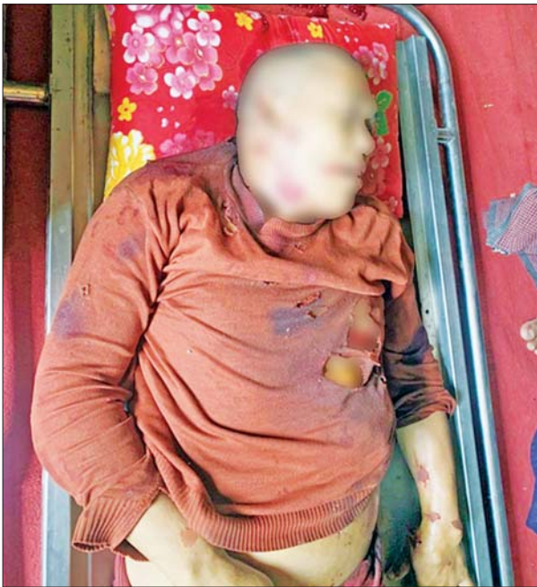
သေနတ်ဖြင့် ၁၁ ချက်ခန့် ရက်ရက်စက်စက်ပစ်ခတ်၍ ဆိုင်ကယ်များ ဖြင့် ပြန်လည်မောင်းနှင်ထွက်ပြေးသွားခဲ့ကြောင်း သိရသည်။

နိုင်ငံရေးအစွန်းရောက် အကြမ်းဖက်သမားများအနေဖြင့် နိုင်ငံတော် အတွင်း တည်ငြိမ်အေးချမ်းမှု ပျက်ပြားစေရန်နှင့် ပြည်သူ့လူထုအကြား စိုးရိမ်ထိတ်လန့်မှု ဖြစ်ပေါ်လာစေရန်ရည်ရွယ်၍ ဌာနဆိုင်ရာ အဆောက်အအုံများ၊ လမ်းတံတားများနှင့် စာသင်ကျောင်းများကို မိုင်းထောင်ဖောက်ခွဲဖျက်ဆီးခြင်း၊ ဆရာ ဆရာမများအပါအဝင် နိုင်ငံ့ဝန်ထမ်းများကို ရက်စက်စွာ လုပ်ကြံသတ်ဖြတ်ခြင်းများ ပြုလုပ် လျက်ရှိသည့်အပြင် ဗုဒ္ဓဘာသာဝင်မြန်မာလူမျိုးများ၏ အထွတ်အမြတ် ထားရာ သာသနာ့ပိုင်ဆိုင်ဆောင်ရွက်မှုများကိုပါ အကြမ်းဖက်ပစ်ခတ် တိုက်ခိုက်ခြင်း၊ မိုင်းထောင်ဖောက်ခွဲခြင်းနှင့် ရဟန်းသံဃာတော် များအား ဖမ်းဆီးခေါ်ဆောင်ခြင်း၊ လုပ်ကြံသတ်ဖြတ်ခြင်းများကို လုပ်ဆောင်လျက်ရှိသည်။