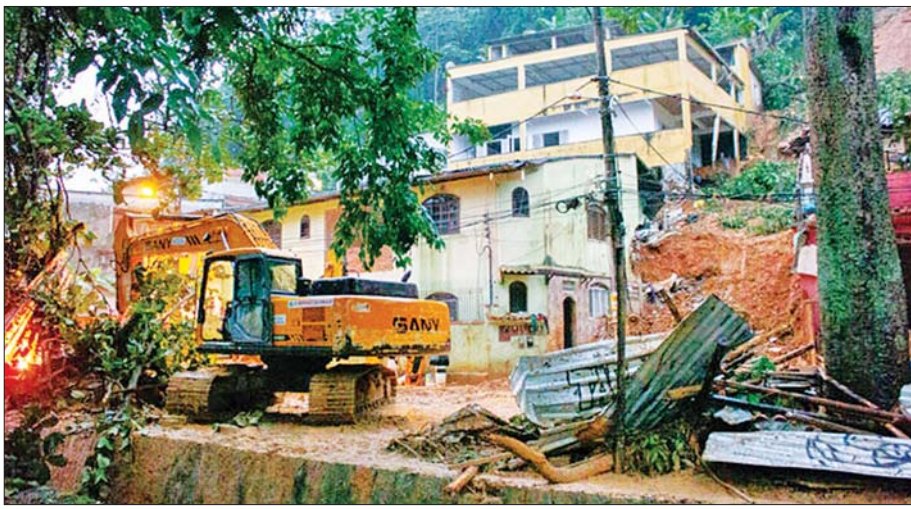
ဘရာဇီးနိုင်ငံ ရီယိုဒီဂျနေရိုး၌ မိုးသည်းထန်စွာရွာသွန်းမှုကြောင့် မြေပြိုနေမှုကို တွေ့ရစဉ်။