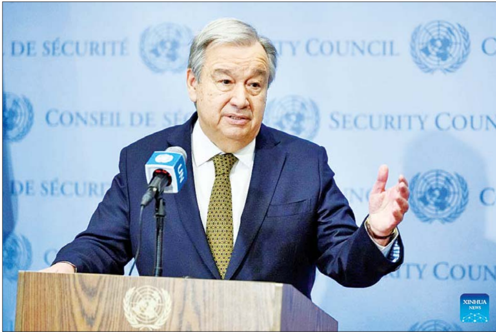
နယူးယောက်ရှိ ကုလသမဂ္ဂ ဌာနချုပ်၌ ကုလသမဂ္ဂ အတွင်းရေးမှူးချုပ် အန်တိုနီယို ဂူတာရက်စ်က ယီမင်ရဲ့ အပစ်ရပ်စဲရေး သဘောတူညီချက် နှင့် ပတ်သက်ပြီး သတင်းထောက် များကို ဧပြီ ၁ ရက် က ရှင်းလင်း ပြောကြားနေစဉ်။

နှစ်လကြာပြီးတဲ့နောက်မှာလည်း ဒီအပစ်ရပ် (ယာယီစစ်ပြေငြိမ်း) သဘောတူညီချက်ကို ပါတီတွေရဲ့ ခွင့်ပြုချက်နဲ့အတူ ထပ်မံ