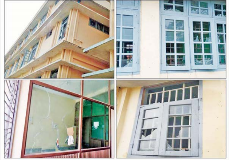
ဗန်းမော်မြို့ ဗန်းမော်တက္ကသိုလ်ဘေးလုံးကွင်းအနီး အမှိုက်ပုံတွင် လက်လုပ်မိုင်း တစ်လုံး ပေါက်ကွဲမှုဖြစ်ပွားခဲ့ပြီး ဗန်းမော်တက္ကသိုလ်ဝင်းအတွင်းရှိ အဆောက်အအုံ များ ထိခိုက်ပျက်စီးမှုများကို တွေ့ရစဉ်။