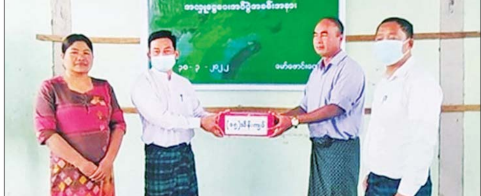
မြစ်ကြီးနားမြို့နယ် မော်ဖောင်းကျေးရွာရှိ မော်ဖောင်း(၁) စိုက်ပျိုးရေးနှင့် အထွေထွေစီးပွားရေးလုပ်ငန်း သမဝါယမအသင်း(လီမိတက်)မှ မတ် ၃၀ ရက်က ကျေးရွာရှိ ဘာသာပေါင်းစုံ နာရေးကူညီမှုအသင်းသို့ အလှူငွေကျပ် ၁၅ သိန်း ပေးအပ်လှူဒါန်းစဉ်။ သမဝါယမဦးစီးဌာန

နွားထိုးကြီး ဧပြီ ၃ ရှင်များကလည်း ဆီဈေးနှုန်း ယခင်က နှမ်း၊ မြေပဲ ကြိုတင်ခွဲ မန္တလေးတိုင်းဒေသကြီး နွားထိုး မြင့်တက်လာ၍ ကြိုတင်ခွဲမှု အလုပ် ကြီးမြို့တွင် နှမ်းဈေး၊ မြေပဲ ဖြစ်နေသော်လည်း ယခုအခါ ဖြစ် နှမ်းဖတ်၊ ပဲဖတ်များဈေးတက်လာ နှမ်းဖတ်၊ ပဲဖတ် တစ်ပိဿာ အမြတ်ယူခဲ့ရာ ယခုအခါ ဆီရော၊ နှမ်းဖတ်၊ ပဲဖတ်ပါမြတ်နေ၍ ဆီကြိတ်လုပ်ငန်းများ အလုပ်ဖြစ် သိရသည်။ အလားတူ မြို့ပေါ်ဆီစက်ပိုင် သည်။ (ဝခရ)