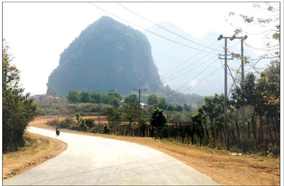
ကာလိမြို့အထွက်မြင်ကွင်း။