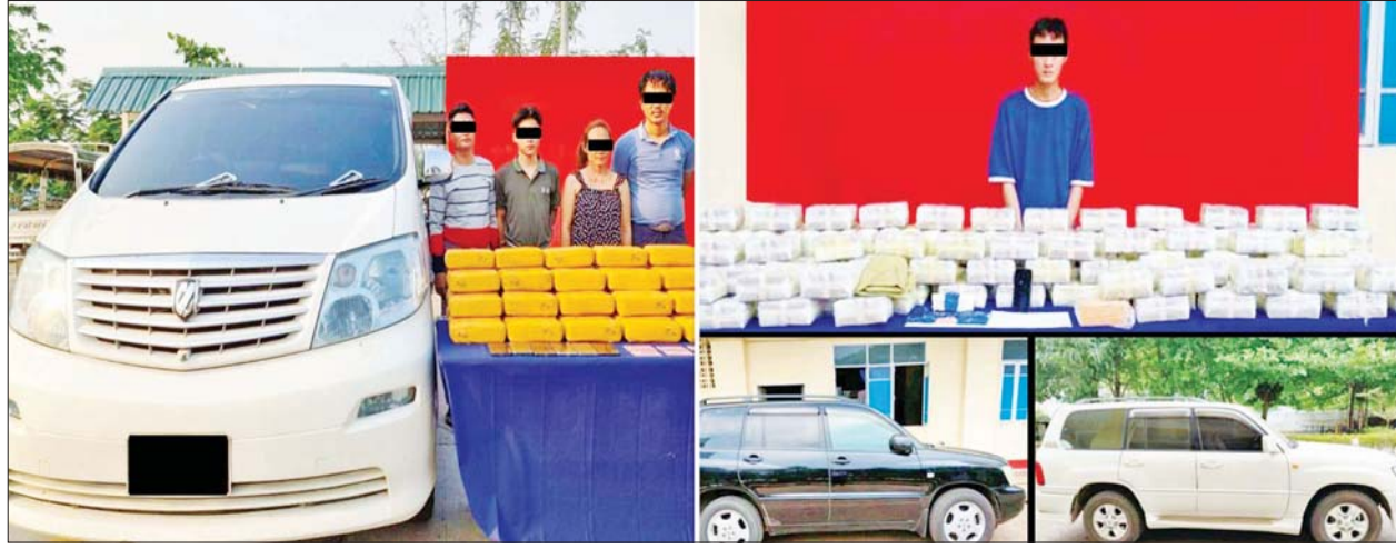
သာစည်မြို့နယ်နှင့် မရမ်းကုန်းမြို့နယ်တို့တွင် သိမ်းဆည်းရမိသည့် စိတ်ကြွေးသွပ်ဆေးပြားများနှင့်အတူ တွေ့ရစဉ်။

နေပြည်တော် ဧပြီ ၃ သာစည်မြို့နယ်နှင့် မရမ်းကုန်းမြို့နယ်တို့တွင် ငွေကျပ် ၂ ဒသမ ၃၉ ဘီလီယံကျော်တန်ဖိုးရှိ စိတ်ကြွေးသွပ်ဆေးပြား ၂၁ သိန်းကျော် ဖမ်းဆီးရမိခဲ့ကြောင်း မြန်မာနိုင်ငံရဲတပ်ဖွဲ့မှ သိရသည်။