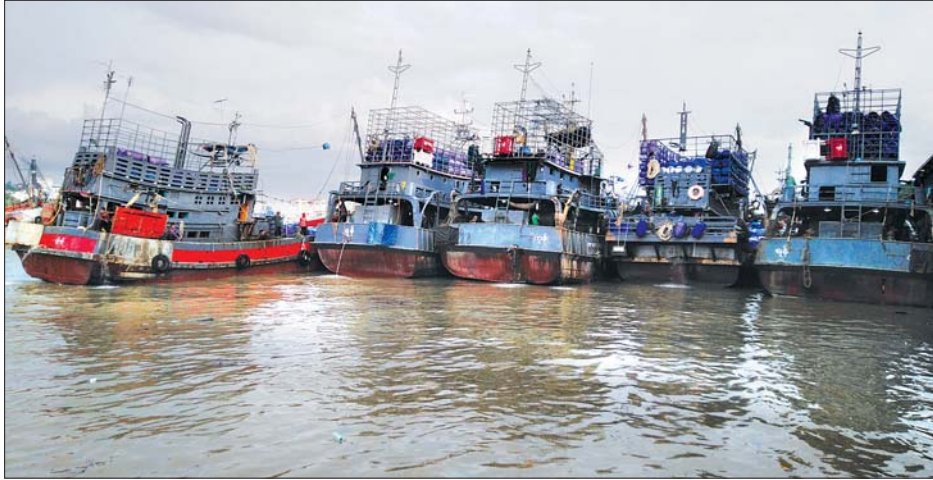
မြိတ်မြို့ဆိပ်ကမ်းတစ်ခု၌ ဆိုက်ကပ်ရပ်နားထားသော ငါးဖမ်းလှေများ။

“မြန်မာ့ပင်လယ်ပြင်မှာ မုတ်သုံရာသီမတိုင်မီ ငါးသားပေါက် အများအပြားပေါက်ပွားပြီး သယ်ဇာတအများဆုံးရှိနိုင်တဲ့ ဖေဖော်ဝါရီဒုတိယပတ်ကနေ မေလဒုတိယပတ်အထိ သုံးလအတွင်း ငါးဖမ်းရာသီ ပိတ်သိမ်းသင့်တယ်ဆိုပြီး သုတေသနရလဒ်ပေါ်ထွက်လာတယ်။ အဲဒီအပေါ်မှာ ကျွန်တော်တို့က ၂၀၂၀ ပြည့်နှစ်မှာ Stakeholder အစည်းအဝေးလုပ်လိုက်တယ်။ ၂၀၂၁ ခုနှစ်မှာ မေ၊ ဇွန်၊ ဇူလိုင်လတွေကို ပိတ်မယ်။ ၂၀၂၂ ခုနှစ်မှာတော့ ဧပြီ၊ မေ၊ ဇွန်လတွေကို ပိတ်မယ်။ ၂၀၂၃ ခုနှစ်မှာတော့ မတ်၊ ဧပြီ၊ မေလတွေကို ပိတ်မယ်ဆိုပြီးတော့ သဘော