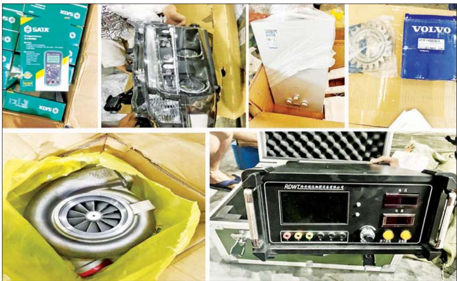
ရန်ကုန်အပြည်ပြည်ဆိုင်ရာ လေဆိပ်၌ ဖမ်းဆီးရမိမှု။

အကောက်ခွန်ဥပဒေနှင့်အညီ အရေးယူ ဆောင်ရွက် လျက်ရှိသည်။ အလားတူ အကောက်ခွန်ဦးစီးဌာန၏ စီမံခန့်ခွဲမှုဖြင့် မြန်မာစက်မှုဆိပ်ကမ်းကုန်သေတ္တာ စစ်ဆေးရေးစခန်း၌ ဆိပ်ကမ်းတာဝန်ကျ အကောက်ခွန်အဖွဲ့မှ စစ်ဆေးမှုများဆောင်ရွက်ခဲ့ရာ သွင်းကုန်ကြေညာလွှာ (ID) နှင့် ကိုက်ညီမှုမရှိသော တရားမဝင် အိမ်သုံးလျှပ်စစ်ပစ္စည်းများ၊ မော်တော်ကား လေကာမှန်များနှင့် အဝတ်အထည်များ (ခန့်မှန်းတန်ဖိုးငွေကျပ် ၁၅၁,၉၀၀,၀၀၀) ဖမ်းဆီးရမိခဲ့ပြီး အကောက်ခွန်ဥပဒေနှင့်အညီ အရေးယူဆောင်ရွက်လျက်ရှိသည်။ ထို့အတူ ဧပြီ ၃ ရက်က စစ်ကိုင်းတိုင်းဒေသကြီး တရားမဝင်ကုန်သွယ်မှုတိုက်ဖျက်ရေး အထူးအဖွဲ့၏