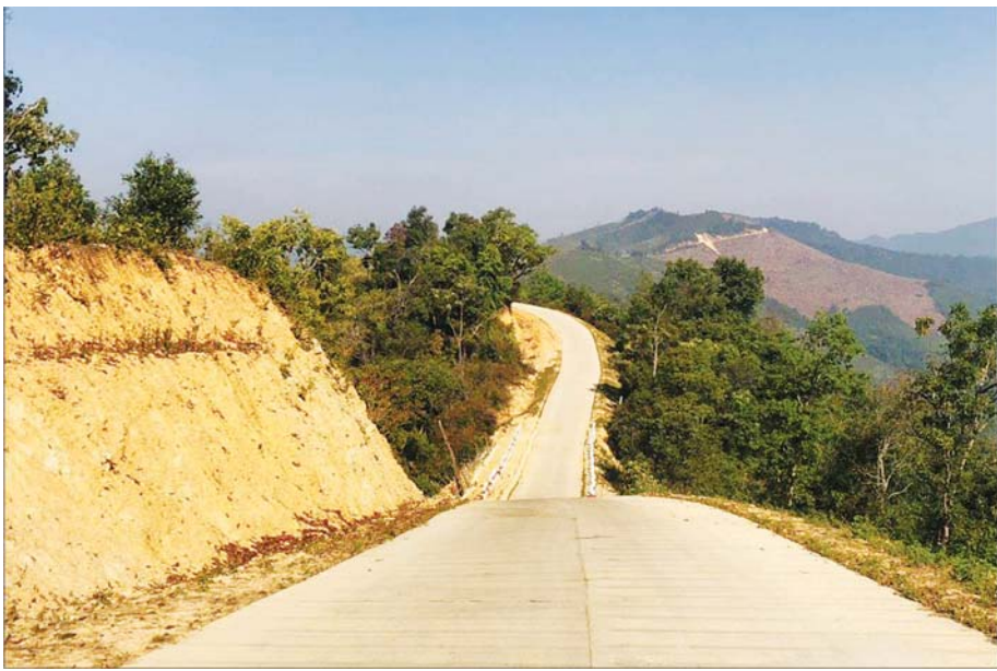
ကွန်ကရစ်ခင်းထားသည့် ဝမ်းတာခက်-မက်မန်းလမ်း။