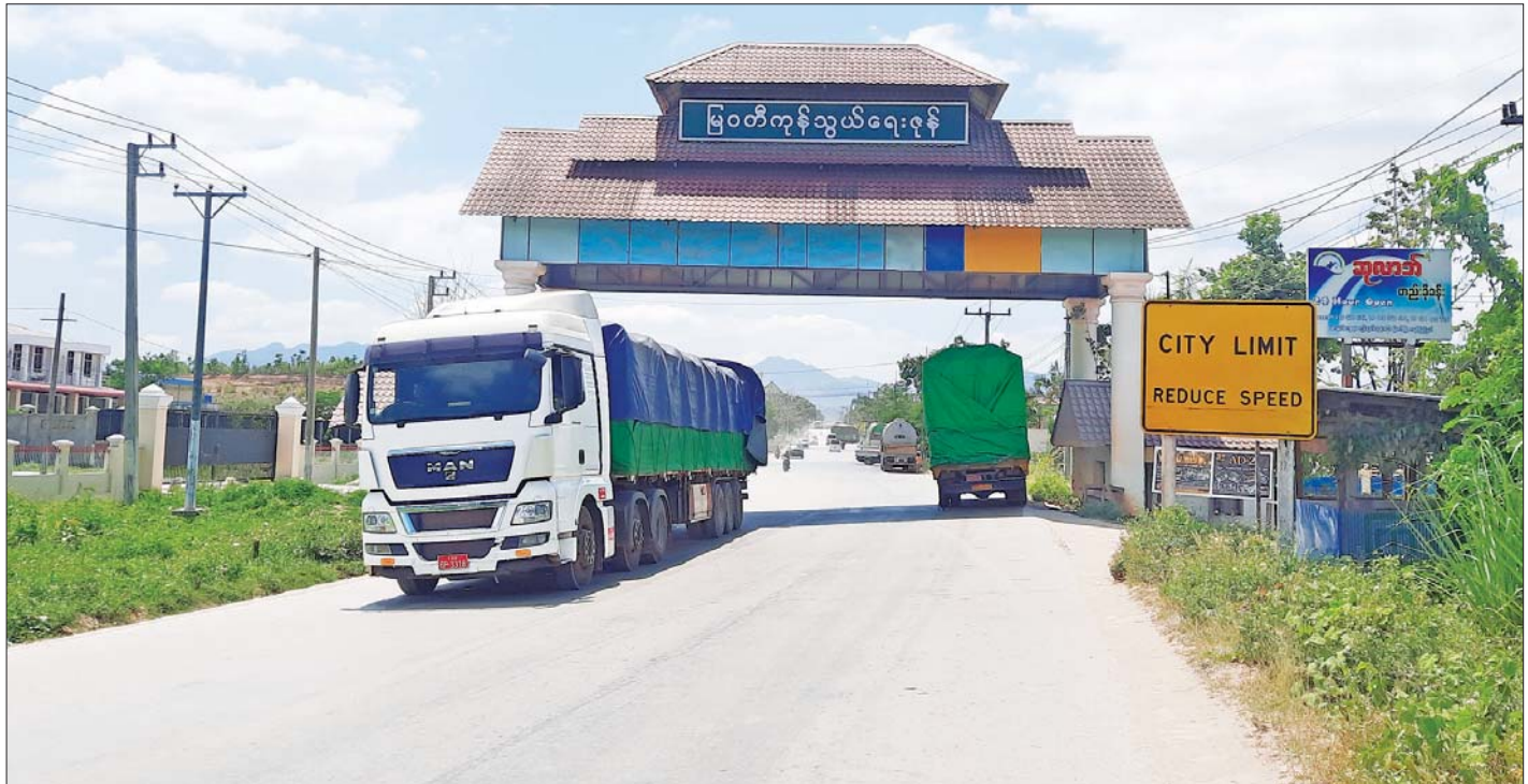
စာမျက်နှာ ၅ ကော်လံ ၁ □ မြဝတီ-ကျောက်ရိတ် အာရှလမ်းမကြီးတွင် ကုန်တင်ယာဉ်များ ဖြတ်သန်းသွားလာနေမှုကို တွေ့ရစဉ်။

မြဝတီ ဧပြီ ၃ မြဝတီနယ်စပ်ကုန်သွယ်ရေး၏ အဓိကလမ်းမကြီးဖြစ်သည့် မြဝတီ-ကျောက်ရိတ် အာရှလမ်းမကြီးတွင် ခရီးသည်တင်ယာဉ်များ၊ အိမ်စီးမော်တော်ယာဉ်များနှင့် ကုန်တင်ယာဉ်များ ပုံမှန်အတိုင်းသွားလာလျက်ရှိပြီး (ယာပုံ) ကုန်စည်စီးဆင်းမှုအနေဖြင့်လည်း ပုံမှန်ဆောင်ရွက်လျက်ရှိကြောင်း သိရသည်။ “ကားတွေကတော့ ပုံမှန်အတိုင်း သွားလာနေတာပါ။ ယခင် ရက်ပိုင်းကတော့ တံတားပြုပြင်တာတွေ ဆောင်ရွက်နေတဲ့အတွက် နာရီပိုင်းပိတ်ပြီး ပြန်ဖွင့်ပါတယ်။ တချို့သတင်းတွေ တက်နေသလို အခုထိ ပိတ်ထားတုန်း၊ ကုန်စည်စီးဆင်းမှုတွေ ရပ်နားထားရလို့ ကုန်ဈေးနှုန်းတွေလည်း တက်နေပြီဆိုတာ မဟုတ်ပါဘူး။ ပြီးခဲ့တဲ့ ရက်ပိုင်းတုန်းကတော့ ကားတွေ ပစ်တာ၊ မီးရှို့တာတွေလုပ်တော့ ကုန်တင်ယာဉ်တွေက စိုးရိမ်မှုတွေရှိတာပေါ့။ ဒါပေမယ့် ပုံမှန်အတိုင်းပဲ သွားလာနေပါတယ်” ဟု ကုန်တင်ယာဉ်မောင်းသူ တစ်ဦးက ပြောသည်။