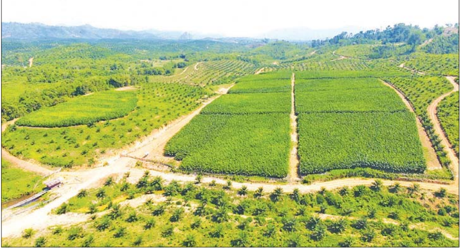
ကော့သောင်းခရိုင်အတွင်းရှိ ဆီအုန်းစိုက်ခင်းများ။

ကုမ္ပဏီအများအပြားက ဆီအုန်းစိုက်ပျိုးမှုအတွက် လာရောက်ရင်းနှီးမြှုပ်နှံ လုပ်ကိုင်လျက်ရှိသည်။ လွန်ခဲ့သည့် နှစ်ပေါင်း ၃၀ ကျော်မှစတင်ပြီး တနင်္သာရီတိုင်းဒေသကြီးတွင် ဆီအုန်းစိုက်ပျိုးမှုစတင်ခဲ့ရာ ယခုအခါ တိုင်းဒေသကြီးတစ်ခုလုံးတွင် ဧက လေးသိန်းကျော် စိုက်ပျိုးထားသည်။ တနင်္သာရီ တိုင်းဒေသကြီးအတွင်း၌ ဆီအုန်းစိုက်ပျိုးမှု ဧကလေးသိန်းကျော် ရှိသည့်အနက် မြိတ်ခရိုင်နှင့် ကော့သောင်းခရိုင်တို့တွင် ဆီအုန်းစိုက်ပျိုးမှု အများဆုံးဖြစ်ပြီး ကော့သောင်းခရိုင်တွင် ဆီကြမ်းစက်ရုံ နှစ်ရုံရှိကြောင်း သိရသည်။