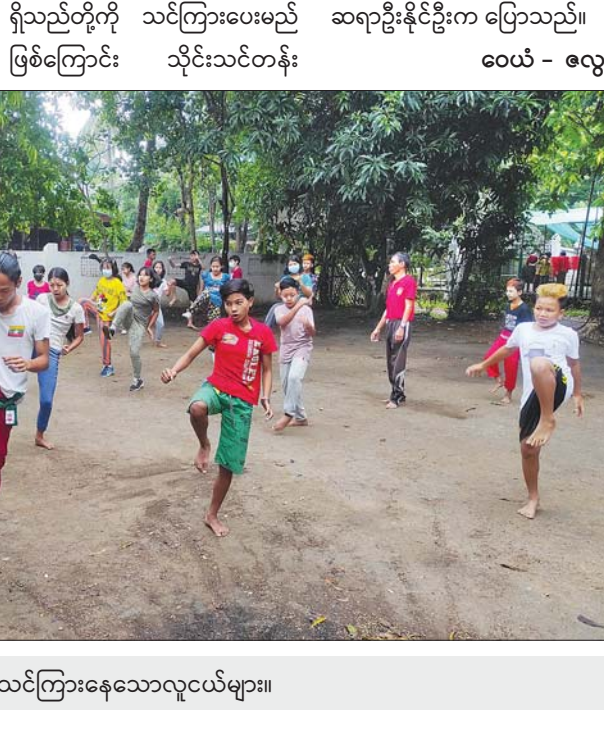
သင်တန်းတွင် မြန်မာ့သိုင်းပညာ သင်ကြားနေသောလူငယ်များ။