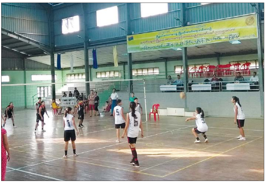
တနင်္သာရီတိုင်းဒေသကြီး သရက်ချောင်းမြို့နယ် ကျောင်းပေါင်းစုံ အမျိုးသမီးဘော်လီဘောပြိုင်ပွဲတွင် ယှဉ်ပြိုင်နေသည့် ကျောင်းသူလေးများ။

(ဂ) သည်းခံစိတ်ရည်စွမ်းရည်မြင့်မားလာခြင်း အားမာန်သုံး၍ ပြေးလွှား၊ လှည့်ပတ်ယှဉ်ပြိုင် ကစားရသည့် ဘောလုံး၊ ဘတ်စကက်ဘောကစား နည်းမျိုးကဲ့သို့ ကစားပွဲများတွင် ထိခိုက်ကြ၊ နာကျင် ကြပါသည်။ ထို့အတူ တစ်သက်သက်တိုက်ခိုက် ခြင်းမျိုး၊ ကိုယ်နှုတ်အမူအရာဖြင့် စော်ကားခြင်းမျိုး လည်း ခံရတတ်ပါသည်။ မောပန်းပြီး ဒေါသ ထွက်လွယ်သည့်အချိန်မျိုးမှာ သည်းခံမှုကင်းကာ ပြန်လည်တုံ့ပြန်ခဲ့လျှင် ပြစ်ဒဏ်ပေးခံရပါမည်။ တုံ့ပြန်မှုအားကြီးလျှင် ပြိုင်ပွဲကထွက်ရပါလိမ့်မည်။ ထိုသို့မဖြစ်ရန် မိမိပြိုင်ဘက်ကို သည်းခံရသလို ကိုယ့်ကစားဖော်၏ အားနည်းချက်ကြောင့် အသင်း ရှုံးခဲ့လျှင် (သို့မဟုတ်) ပြစ်ဒဏ်ခံရလျှင်လည်း အပြစ် တင်မည့်အစား အားပေးရပါသည်။