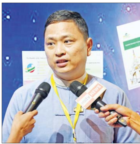
ဒုတိယညွှန်ကြားရေးမှူးချုပ် ဦးမင်းဇော်ဦး

ဘယ်သူတွေအသုံးပြုနိုင်မလဲ၊ ဘယ်လိုအသုံးပြုနိုင်