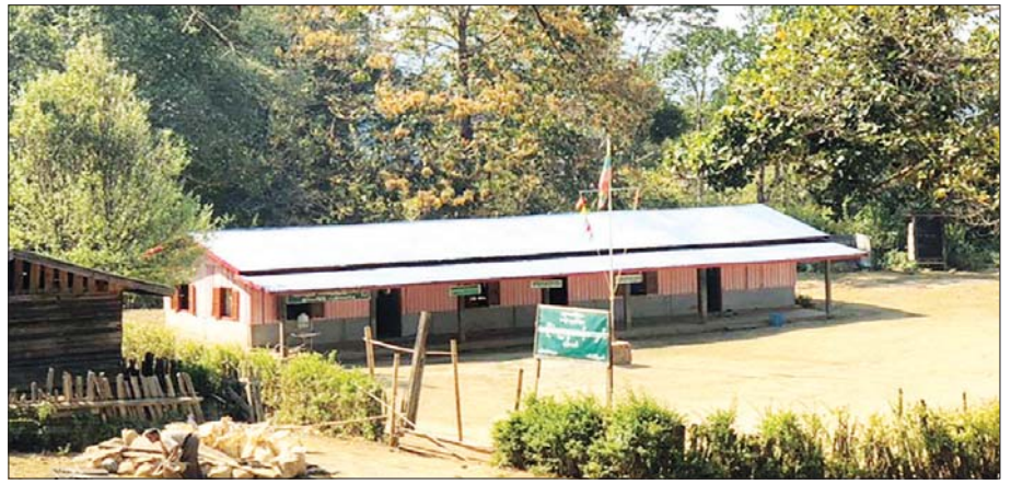
နမ့်တော်ကျေးရွာ အခြေခံပညာမူလတန်းကျောင်းကို တွေ့ရစဉ်။