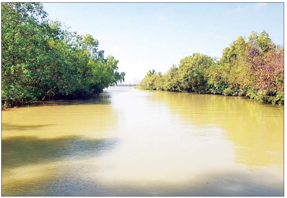
ဒီရေတောကြိုးပြင်ကာကွယ်တောအဖြစ် သတ်မှတ် ကြေညာခြင်းဖြစ်ပါသည်။ သယံဇာတနှင့်သဘာဝပတ်ဝန်းကျင် ထိန်းသိမ်းရေးဝန်ကြီးဌာန

ကာကွယ်တောဧရိယာအတွင်း ဒီရေတောအပင် မျိုးစိတ်များဖြစ်သည့် သမု၊ ကန်ပလာ၊ ဗြူးခြေ ထောက်၊ ဗြူးအုပ်ဆောင်း၊ လမု၊ ကနစို၊ ကျနပင်များ ပေါက်ရောက်ပြီး ငါး၊ ပုစွန်၊ ကဏန်းတို့ပေါက်ဖွားရာ နေရင်းဒေသများလည်းဖြစ်ပါသည်။ ငှက်ကြီး ဝံဗို၊ ငှက်ကျား၊ မယ်သူတော်၊ မျိုင်း စသည့် ရေပျော်ငှက် များ ကျက်စားရာဒေသလည်း ဖြစ်ပါသည်။ ဒီရေတောကြိုးပြင်ကာကွယ်တော သတ်မှတ် ကာကွယ်ထိန်းသိမ်းလိုက်ခြင်းဖြင့် ဒီရေတောများ စနစ်တကျ စီမံအုပ်ချုပ်နိုင်ခြင်း၊ အစိမ်းရောင် သဘာဝတံတိုင်းတစ်ခုအဖြစ် ဒီရေတောများ ပေါ်ထွက်လာခြင်း၊ သစ်တောပြုန်းတီးမှုထိန်းသိမ်း ကာကွယ်နိုင်ခြင်း၊ သစ်တောဖုံးလွှမ်းမှုများ တိုးပွား လာ၍ ဂေဟစနစ်ဝန်ဆောင်မှုများ တိုးပွားလာခြင်း၊ ရာသီဥတုသာယာမှုတစ်ခြင်း၊ သား၊ ငါး၊ ပုစွန်များ ပေါက်ကြွယ်ဝခြင်း၊ ဒေသခံပြည်သူများအတွက် သစ်၊ ထင်း လိုအပ်ချက်များ ဖြည့်ဆည်းပေးနိုင်ခြင်း စသည့်အကျိုးကျေးဇူးများစွာ ရရှိနိုင်မည်ဖြစ်၍