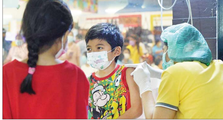
ထိုင်းနိုင်ငံ၌ ကလေးငယ်တစ်ဦးကို ကိုဗစ်-၁၉ ကာကွယ်ဆေး ထိုးပေးနေသည်ကို တွေ့ရစဉ်။

ဘန်ကောက် ဧပြီ ၁ ထိုင်းနိုင်ငံ၌ လွန်ခဲ့သော ၂၄ နာရီအတွင်း ကိုဗစ်-၁၉ နောက် ထပ်မံကူးစက်ခံရသူ ၂၈၃၇၉ ဦး ထပ်မံတွေ့ရှိသဖြင့် ယခုအချိန် အထိ ကိုဗစ်-၁၉ နေ့စဉ်ကူးစက်မှု နှုန်းအမြင့်ဆုံးဖြစ်ကြောင်း သိရ သည်။ ထိုင်းနိုင်ငံ၌ ကိုဗစ်-၁၉ ရောဂါ ကူးစက်ခံရသူစုစုပေါင်းမှာ ၃ ဒသမ ၆၅ သန်းကျော် ရှိလာပြီ ဖြစ်သည်။ ကိုဗစ်-၁၉ ရောဂါ နေ့စဉ် ကူးစက်မှုနှုန်းမှာ သုံးရက် ဆက်တိုက်တိုးလာခဲ့ပြီး မတ် ၃၁ ရက်က ရောဂါကူးစက်ခံရသူ ၂၇၅၆၀ ရှိပြီး ထိုင်းနိုင်ငံ ဘန်ကောက်မြို့တွင် လွန်ခဲ့သော ၂၄ နာရီအတွင်း ကိုဗစ်-၁၉ ရောဂါကူးစက်ခံရသူ ၃၃၅၀ ရှိ ကြောင်း ကိုဗစ်-၁၉ ရောဂါ စီမံ ခန့်ခွဲရေးဌာန (CCSA) ၏ ထုတ်ပြန် ချက်အရ သိရသည်။ ထိုင်းနိုင်ငံသည် ခရီးသွား ကဏ္ဍ ပြန်လည်ရှင်သန်ရန် အတွက် နိုင်ငံအတွင်းဝင်ရောက် ရန် ကိုဗစ်-၁၉ စည်းမျဉ်း စည်းကမ်းများကို ဖြေလျှော့ပေး