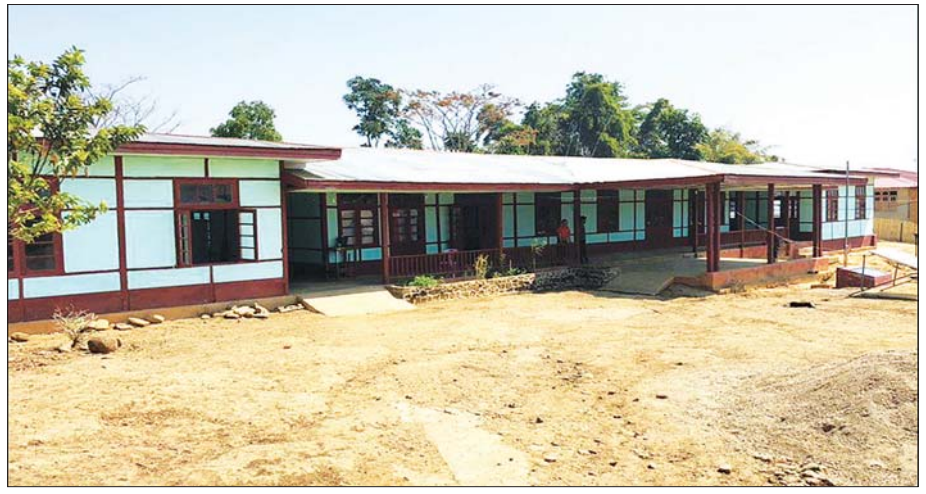
ဆွတ်ပိုး တိုက်နယ်ဆေးရုံကို တွေ့ရစဉ်။