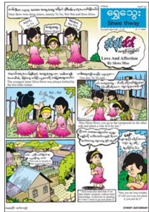
ပုဏ္ဏားကို ဉာဏ်ပညာနှင့် ယှဉ်ကာ ပြည့်စုံစွာဖြင့် ဖြေဆိုနိုင်ပုံအကြောင်း တင်ဆက်ထားသည့် “မောင်သုတရဲ့ အဖြေ” ပုံပြင်ကဏ္ဍအပါအဝင် အင်္ဂလိပ်စာကဏ္ဍ၊ ဉာဏ်စမ်းကဏ္ဍ၊ ကဗျာကဏ္ဍ စုံလင်စွာဖြင့် ထွက်ရှိပြီဖြစ်ရာ တစ်စောင်လျှင် ငွေကျပ် ၄၀၀ ဖြင့် စာပေဗိမာန်စာအုပ်အရောင်းဆိုင်များတွင် ဝယ်ယူနိုင်ကြောင်း သိရသည်။

ဆောင်းပါး၊ ကလေးတို့ကိုယ်တိုင် ရေးဆွဲထားသည့် ပန်းချီလက်ရာများကို တင်ဆက်ထားသည့် “ရွှေသွေးတို့လက်ရာ” ကဏ္ဍ၊ ရွှေသေတ္တာကြီးကို ပိုင်ဆိုင်ခွင့်ရသွားသော ရိုးသားပွင့်လင်းသည့် သစ်ခုတ်သမားအကြောင်း ရေးဖွဲ့ထားသည့် “သစ်ခုတ်သမားနှင့် ရွှေအိုးကြီး” နှစ်မျက်နှာကာတွန်း၊ မျက်လှည့်ပညာ အချို့သည် ပရိသတ်၏မျက်စိကို လှည့်စားရုံသာမက အသိဉာဏ်ကိုပါလှည့်စားတတ်ပုံအကြောင်း တင်ဆက်ထားသည့် “မျက်လှည့်ပွဲ” ဝတ္ထုကဏ္ဍ၊ ကိုရီးယားစကားပြော သင်တန်းတက်နေသည့်ဆိုသော တူးမာအကြောင်း ရေးဖွဲ့ထားသည့် “ဖိုးလပြည့်” တစ်မျက်နှာကာတွန်း၊ သားတော်ထွေး မောင်သုတသည် ခမည်းတော်ဘုရင်ကြီး၏ မေးခွန်း