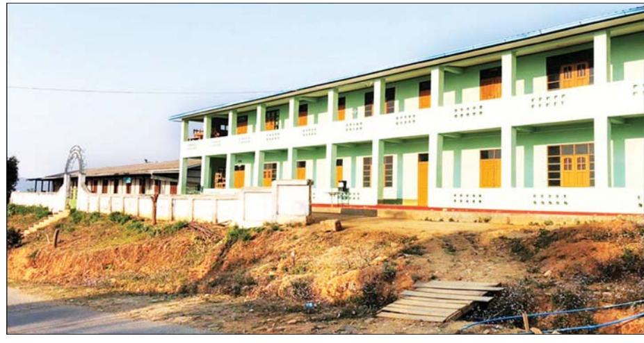
မက်မန်းမြို့ အခြေခံပညာ အထက်တန်းကျောင်းကို တွေ့ရစဉ်။

ဆိုင်ရာဝန်ထမ်းများ၊ ဒေသခံပြည်သူများ ပိုင်းဝန်းပူးပေါင်း ဆောင်ရွက်ခဲ့ကြပါ သည်။ အမှတ်တရ ရုပ်သံထပ်ဆင့်လွှင့်စက်ရုံ ၂၀၀၃ ခုနှစ်အတွင်း ကျင်းပပြုလုပ် သော နတလလုပ်ငန်းကော်မတီ လေးလ ပတ်အစည်းအဝေးတစ်ခု၌ ပတလ (ရှမ်း) ဥက္ကဋ္ဌ၊ အရှေ့ပိုင်းတိုင်းစစ်ဌာနချုပ် တိုင်းမှူးက မက်မန်းမြို့အတွက် ရုပ်မြင် သံကြားထပ်ဆင့်လွှင့်စက်ရုံ ခွင့်ပြုပေး ပါရန် တင်ပြခဲ့ရာ နတလလုပ်ငန်း ကော်မတီဥက္ကဋ္ဌက ရုတ်တရက်အံ့အား သင့်သွားပြီး “ဟာကွာ - မက်မန်းမှာ ရုပ်သံမရှိသေးဘူးလား ... ငါတို့ တည်ပေး ခဲ့တဲ့မြို့ကွာ ရပြီးပြီထင်နေတာ၊ တော်တော် နောက်ကျနေပြီ၊ ပေးမယ်ကွာ” ဟု ပြော၍ ခွင့်ပြုပေးခဲ့သည်ကို ကျွန်တော် အမှတ်ရမိသည်။ နတလအနေဖြင့် ရုပ်မြင်သံကြားထပ်ဆင့်လွှင့် စက်ရုံများ ကို ၁၉၉၄ ခုနှစ်အတွင်းမှာပင် ပန်ဆန်း၊ မိုင်းမော၊ လောကီကိုင်း၊ မိုင်းယန်း၊ မိုင်းခတ်၊ ဆီလူး၊ မိုင်းလား၊ နမ့်ဖတ်ကာ၊ မိုင်းဆတ်၊ ဘုတ်ပြင်၊ ကလိန်အောင်၊ တနိုင်းနှင့် ဖာပွန်တို့တွင် တည်ဆောက် ထုတ်လွှင့် ပြသပေးနိုင်ခဲ့ပြီဖြစ်သည်။ ၂၀၀၂ ခုနှစ်အထိမှာပင် ၉၃ ရုံ ခွင့်ပြုချထား ပေးပြီး ဖြစ်ပါသည်။ စာမျက်နှာ ၁၇ သို့