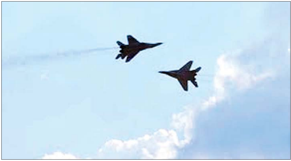
လေ့ကျင့်ရေးဂျက်လေယာဉ်နှစ်စင်း တိုက်မိမှုမဖြစ်ခင် တွေ့ရစဉ်။

အလီဂရီယာသည် အာကာသခရီးစဉ် အုပ်ချုပ်သူ အရာရှိအဖြစ် တာဝန်ထမ်းဆောင်မည်ဖြစ်သည်။ အမေရိကန်ပြည်ထောင်စုမှ ကော်နာသည် အာကာသ ယာဉ်မှူးအဖြစ် တာဝန်ထမ်းဆောင်မည်ဖြစ်သည်။ ကနေဒါမှ ပါသီနှင့် အစ္စရေးမှ စတစ်ဘီတို့သည် အာကာသခရီးစဉ် အထူးကျွမ်းကျင်သူများအဖြစ် လိုက်ပါ တာဝန်ထမ်းဆောင်မည်ဖြစ်ကြောင်း နာဆာထုတ်ပြန်ချက်အရ သိရသည်။ ၁၀ ရက်ကြာ အာကာသခရီးစဉ်အတွင်း အမှုထမ်း များသည် နိုင်ငံတကာအာကာသစခန်း (အိုင်အက်စ် အက်စ်)တွင် ရှစ်ရက်ကြာ နေထိုင်သွားမည်ဖြစ်ပြီး သိပ္ပံနည်းကျသုတေသနများနှင့် တခြားဆောင်ရွက် ချက်များကို ပြုလုပ်သွားမည်ဖြစ်သည်။ ဆင်ဟွာ