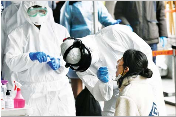
တောင်ကိုရီးယားနိုင်ငံ ဆိုးလ်မြို့တွင် ကိုဗစ်-၁၉ စစ်ဆေးရန် လုပ်ဆောင်နေသည်ကို တွေ့ရစဉ်။