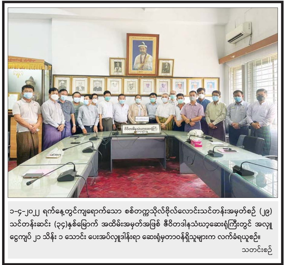
၁-၄-၂၀၂၂ ရက်နေ့တွင်ကျရောက်သော စစ်တက္ကသိုလ်ဗိုလ်လောင်းသင်တန်းအမှတ်စဉ် (၂၉) သင်တန်းဆင်း (၃၄)နှစ်မြောက် အထိမ်းအမှတ်အဖြစ် ဇီဝိတဒါနသံဃာ့ဆေးရုံကြီးတွင် အလှူငွေကျပ် ၂၁ သိန်း ၁ သောင်း ပေးအပ်လှူဒါန်းရာ ဆေးရုံမှတာဝန်ရှိသူများက လက်ခံရယူစဉ်။ သတင်းစဉ်

အေးဂျင့်တစ်ဦးက “ဒီလိုလုပ်တာ ကောင်းပါတယ်။ ရုံးတွင်းပိုင်းလုပ်ငန်းနဲ့ ကုန်သွယ်မှု ပိုပြီးမြန်ဆန်တာပေါ့။ အေးဂျင့်တွေအနေနဲ့ အဝါကတ် ရှိထားတဲ့သူတွေပဲ လုပ်ခွင့်ရှိမှာဖြစ်တဲ့အတွက် လူအနည်းစုလောက်ပဲ အဆင်ပြေမယ်ထင်ပါတယ်။ ကုန်သွယ်ရေးကတော့ မြဝတီဘက်မှာလည်း ဒီစနစ်လုပ်ထားပြီဆိုပါတယ်။ မူဆယ်မှာက အခုမှ စလုပ်ရတဲ့အတွက် ပထမပိုင်းမှာ အနည်းငယ်တော့ အခက်အခဲရှိကြမယ်ထင်ပါတယ်။ နောက်တော့ တဖြည်းဖြည်းနဲ့ အားလုံးအဆင်ပြေသွားကြမယ် ထင်ပါတယ်” ဟု ပြောသည်။ သတင်းစဉ်၊ သန့်ဇင်(မူဆယ်)