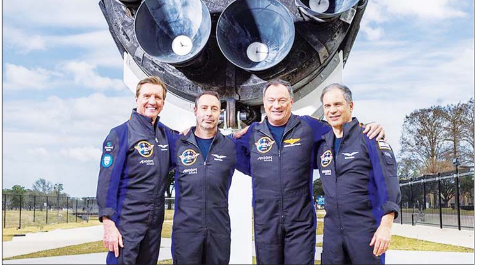
အေဇီယွန်စပေ အာကာသယာဉ်မှူးများကို တွေ့ရစဉ်။

၃၆ မိနစ်တွင် ပျက်ကျခဲ့ခြင်းဖြစ်သည်။ လေယာဉ်ပျက်ကျမှုဖြစ်ပွားရာ နေရာအနီးရှိ နေအိမ်များ ထိခိုက်ပျက်စီးခြင်းနှင့် လူသေဆုံးသတင်း ဖော်ပြခြင်းမရှိသေးကြောင်း သိရသည်။ မီးသတ်တပ်ဖွဲ့များသည် တပ်ဖွဲ့ဝင် ၃၅ ဦးနှင့် အတူ မီးသတ်ယာဉ် ၁၄ စီးနှင့် အခင်းဖြစ်ပွားရာ နေရာတွင် ကယ်ဆယ်ရေးလုပ်ငန်းများ ဆောင်ရွက် လျက်ရှိသည်။ လေ့ကျင့်ရေးဂျက်လေယာဉ်များ ပျက်ကျသည့် အကြောင်းရင်းအတိအကျကို သက်ဆိုင်ရာ အာဏာပိုင်များက စုံစမ်းစစ်ဆေးလျက်ရှိသည်။ ဆင်ဟွာ