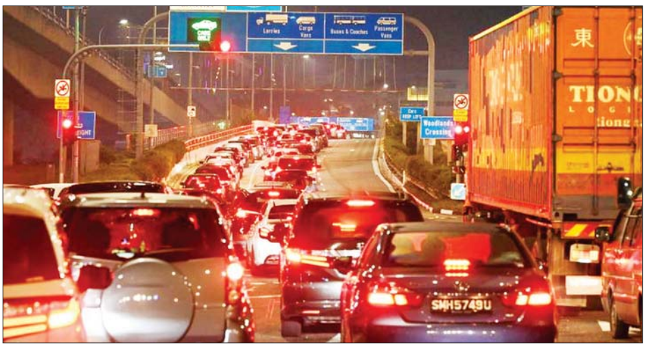
စည်ကားနေသော နှစ်နိုင်ငံ နယ်စပ်ဖြတ်ကျော်လမ်းကို တွေ့ရစဉ်။

စင်ကာပူ ဧပြီ ၁ မလေးရှားနှင့် စင်ကာပူနိုင်ငံတို့သည် ကိုဗစ်-၁၉ ကာကွယ်ဆေးထိုးထားသူများအတွက် နှစ်နိုင်ငံ နယ်စပ် ဖြတ်ကျော်လမ်းကို အပြည့်အဝ ပြန်လည်ဖွင့်လှစ်ပေးလိုက်ပြီဖြစ်ရာ ခရီးသွားများအနေဖြင့် ကိုဗစ်-၁၉ စစ်ဆေးခြင်း သို့မဟုတ် သီးသန့်ကန့်သတ်စောင့်ကြည့်ခြင်းများ မလိုတော့ကြောင်း သိရသည်။ တစ်ကီလိုမီတာ ရှည်သည့် အဆိုပါလမ်း၌ ခရီးသွားများ ဂျီဟော-စင်ကာပူ နယ်စပ် သည် ကားသို့မဟုတ် ခြေကျင် ဖြတ်ကျော်လမ်းသည် ကမ္ဘာပေါ် ဖြတ်ကျော်သွားလာနေကြသည်။ နိုင်ငံဘာလကတည်းက ခရီးသွား များသည် အထူးသတိမှတ်ထား သည့် ဘတ်စ်ကားများဖြင့်သာ ဖြတ်ကျော်သွားလာနိုင်ခဲ့သည်။ ကိုဗစ်-၁၉ ကြောင့် လမ်း မပိတ်ခင် တစ်နေ့လျှင် ခရီးသွား ၃၅၀၀၀၀ ကျော် အဆိုပါနယ်စပ် ဖြတ်ကျော်လမ်းကို အသုံးပြုခဲ့ကြ သည်။ အဆိုပါ နယ်စပ်ဖြတ်ကျော် လမ်းကို ပြန်ဖွင့်လိုက်ခြင်းသည် ကိုဗစ်-၁၉နှင့်အသားတကျနေထိုင် ခြင်းကို ဖော်ပြသော သိသာသည့် သမိုင်းမှတ်တိုင်တစ်ခုဖြစ်သည်။ အင်န်အိတ်ချီကေ