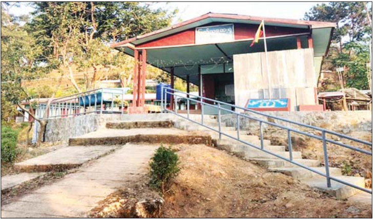
မက်မန်းမြို့ ပြည်သူ့ဆေးရုံကို တွေ့ရစဉ်။

မက်မန်းသို့ ရောက်တန်းရောက်ခိုက် အေးကျန်ရွာလေးရှိရာသို့ သွားခဲ့ကြသေး သည်။ ထိုနေရာမှ လှမ်းမျှော်ကြည့်လျှင် ပွိုင့် ၆၀၂၈ တောင်ကုန်း၊ ပွိုင့် ၇၁၂၃ လွယ်ဟိုလာကုန်းတို့ကို မြင်နေရပါသည်။ လွယ်ဟိုလာဟု ဆိုလိုက်သည်နှင့် ထို ကုန်းအနီးတစ်ဝိုက်မှာ ကျောက်ချည်ပေါင်၊ ကျောက်ချင်း၊ တစ်ပင်တိုင်မျှစ်၊ မြက် ကြွပ်၊ ဝါးရောင်းချည်၊ ကြိမ်ခါးဖူး၊ မင်းဘော ဖူး စသောအသီးအရွက်များ ရှာဖွေ စားသောက်ခဲ့ရသည်ကို အမှတ်ရနေမည့် အရာရှိ အကြပ်စစ်သည်များစွာ ရှိနေပါ လိမ့်မည်။ နောက်တစ်နေ့ မတ်လ ၅ ရက် နေ့မှာ မက်မန်းမြို့လေးမှ ပြန်လည် ထွက်ခွာခဲ့ကြသည်။ နှုတ်ဆက်ခဲ့ပါတယ် မက်မန်းမြို့လေးရေ ...။ ။