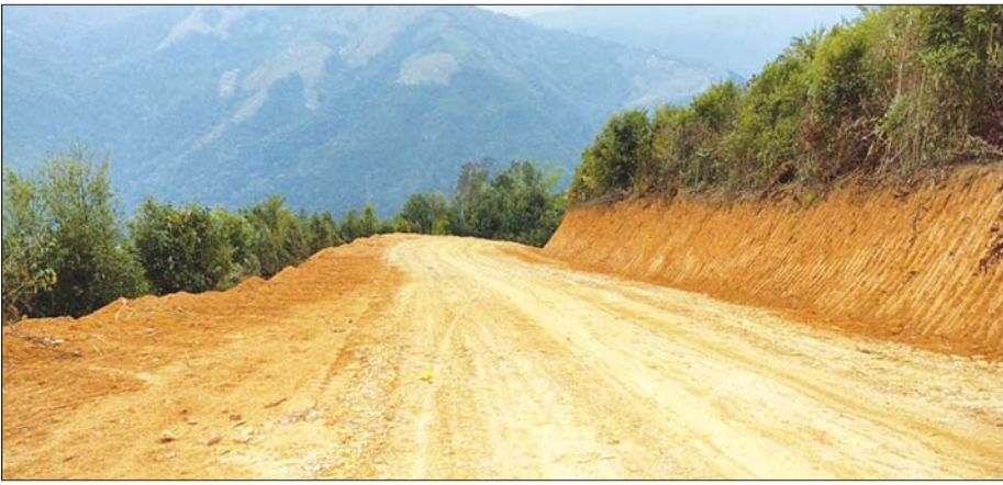
ဆွတ်တိုးကျေးရွာအုပ်စုအတွင်းရှိ နမ့်ကျွတ် - ပန်ကောက် - ရောင်ပန် မြေလမ်း ၁၂/၀ မိုင် ဖောက်လုပ်ထားစဉ်။