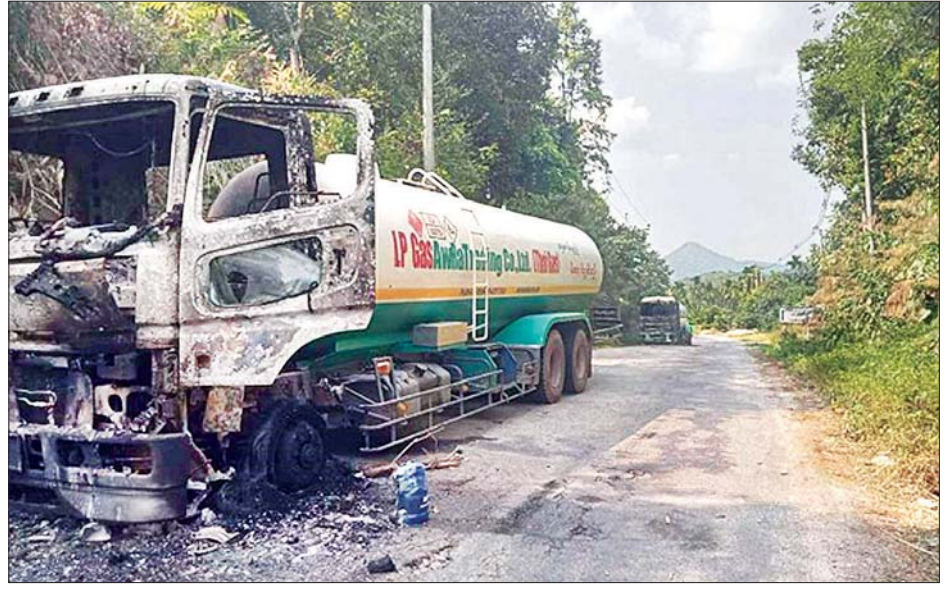
ဖော်ထုတ်အရေးယူနိုင်ရေးနှင့် နယ်မြေလုံခြုံရေး ဆက်လက်ဆောင်ရွက်လျက်ရှိကြောင်း သတင်းအတွက် လုံခြုံရေးတပ်ဖွဲ့ဝင်များက လိုအပ်သည်များ ရရှိသည်။ သတင်းစဉ်

မပြတ်ပစ်ခတ်ခဲ့သဖြင့် ယာဉ်မောင်းနှင်ဦးမှာ ကားပေါ်မှဆင်း၍ ထွက်ပြေးခဲ့ရကြောင်း၊ ထိုသို့ ထွက်ပြေးစဉ် အကြမ်းဖက်သမားများက ၎င်းတို့၏ ဖော်တော်ယာဉ်နှစ်စီးပေါ်တွင်ပါရှိသည့် ငွေသားများ၊ လက်ဝတ်ရတနာများနှင့် အသုံးအဆောင်ပစ္စည်းများကို ယူဆောင်ကာ ယာဉ်များကို မီးရှို့ဖျက်ဆီးခဲ့ကြောင်း သိရှိရသည်။ ထိုကဲ့သို့ စစ်ရေးပစ်မှတ်မဟုတ်သည့် အများပြည်သူသွားလာနေသည့် လမ်းမကြီးပေါ်ရှိ ခရီးသွားပြည်သူများနှင့် ကုန်စည်တင်ဖော်တော်ယာဉ်များအား ပစ်မှတ်ထား ပစ်ခတ်တိုက်ခိုက်ခြင်းသည် လူမှုစီးပွားကို ထိခိုက်ပျက်စီးစေပြီး ကုန်စည်စီးဆင်းမှုကို အဟန့်အတားဖြစ်စေသဖြင့် အကြမ်းဖက်လုပ်ရပ်များကို တစ်ဖက်သတ်အစွန်းရောက် ဝါဒစွဲအပေါ်အခြေခံကာ အသိညာဏ်နည်းပါးစွာ လုပ်ဆောင်ခဲ့သည့် အကြမ်းဖက်သမားများအား