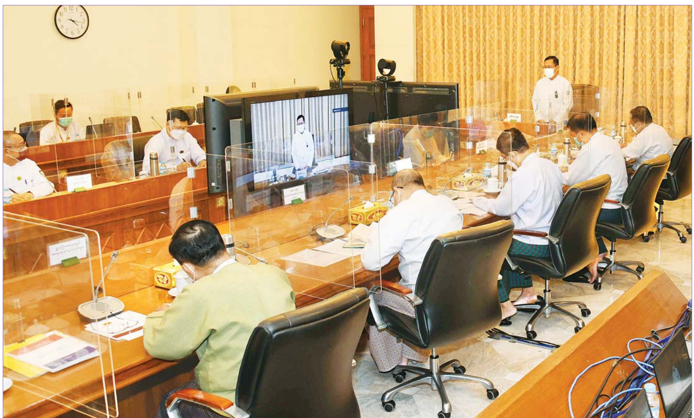
နိုင်ငံတော်စီမံအုပ်ချုပ်ရေးကောင်စီ ဒုတိယဥက္ကဋ္ဌ ဒုတိယဝန်ကြီးချုပ် ဒုတိယဗိုလ်ချုပ်မှူးကြီး စိုးဝင်း ရွေးကောက်ပွဲအတွက် မဲစာရင်းပြုစုရေးဆိုင်ရာ အစည်းအဝေးတွင် အမှာစကားပြောကြားစဉ်။

နေပြည်တော် ဧပြီ ၁ ရွေးကောက်ပွဲအတွက် မဲစာရင်းပြုစုရေးဆိုင်ရာ အစည်းအဝေးကို ယနေ့ညနေပိုင်းတွင် နိုင်ငံတော်စီမံအုပ်ချုပ်ရေးကောင်စီဥက္ကဋ္ဌရုံး အစည်းအဝေးခန်းမ၌ကျင်းပရာ နိုင်ငံတော်စီမံအုပ်ချုပ်ရေးကောင်စီ ဒုတိယဥက္ကဋ္ဌ ဒုတိယဝန်ကြီးချုပ် ဒုတိယဗိုလ်ချုပ်မှူးကြီး စိုးဝင်း တက်ရောက်အမှာစကားပြောကြားသည်။ အစည်းအဝေးသို့ ရွေးကောက်ပွဲကော်မရှင်ဥက္ကဋ္ဌ ဦးသိန်းစိုး၊ ပြည်ထောင်စုဝန်ကြီးများဖြစ်ကြသည့် ဒုတိယဗိုလ်ချုပ်ကြီး စိုးထွဋ်၊ ဦးခင်ရီနှင့် ဒေါက်တာမျိုးသိန်းကျော်၊ ရွေးကောက်ပွဲကော်မရှင်အဖွဲ့ဝင် ဦးအောင်လွင်ဦး၊ ဒုတိယဝန်ကြီးများဖြစ်ကြသည့် ဦးဌေးလှိုင်၊ ဦးဇော်ဝင်း၊ ဦးအောင်ထွန်းခိုင်နှင့် တာဝန်ရှိသူများ တက်ရောက်ကြပြီး နေပြည်တော်ကောင်စီဥက္ကဋ္ဌ တိုင်းဒေသကြီးနှင့် ပြည်နယ်များမှ ဝန်ကြီးချုပ်များက ဗီဒီယိုကွန်ဖရင့်စနစ်ဖြင့် တက်ရောက်ကြသည်။ ဦးစွာ နိုင်ငံတော် စီမံအုပ်ချုပ်ရေးကောင်စီ ဒုတိယဥက္ကဋ္ဌ ဒုတိယဝန်ကြီးချုပ် ဒုတိယဗိုလ်ချုပ်မှူးကြီး စိုးဝင်းက ၂၀၂၃ ခုနှစ်တွင် ကျင်းပရန်ရည်ရွယ်ထားသည့် ရွေးကောက်ပွဲဆိုင်ရာ ကိစ္စရပ်များနှင့် စပ်လျဉ်း၍ ညှိနှိုင်းဆွေးနွေးသည့် အစည်းအဝေးဖြစ်ကြောင်း၊ မတ် ၁၄ ရက်နှင့် ၂၅ ရက်တို့တွင် စာမျက်နှာ ၃ ကော်လံ ၁ ❖