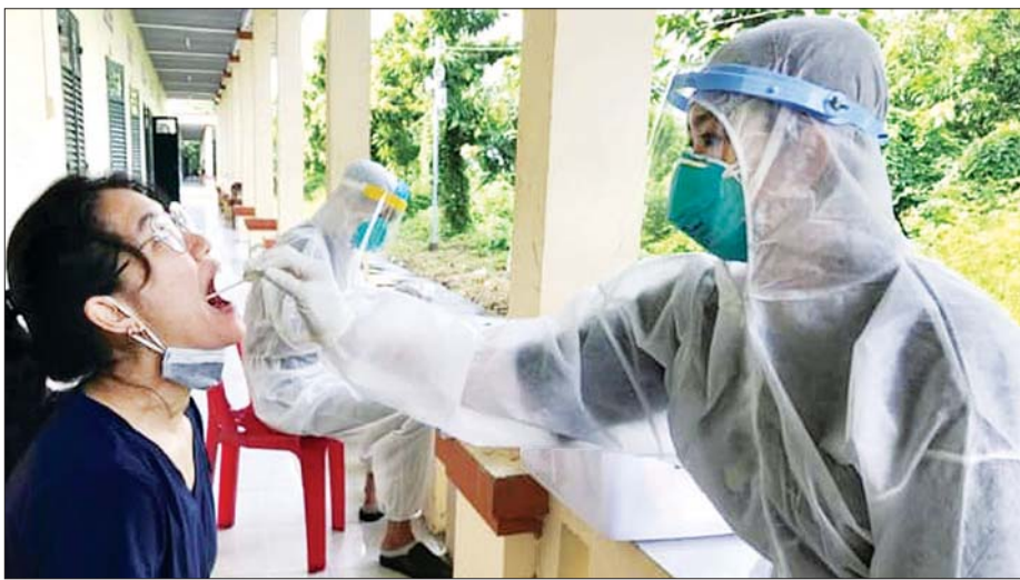
ကိုဗစ်-၁၉ စစ်ဆေးရန် ဗီယက်နမ်နိုင်ငံ၌ အမျိုးသမီးတစ်ဦးအား အာခေါင်တို့ဖတ် နမူနာယူနေသည်ကို တွေ့ရစဉ်။