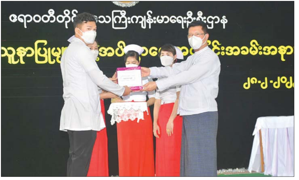
ပြောကြားသည်။ ထို့နောက် တိုင်းဒေသကြီးဝန်ကြီးချုပ်က သစ်လွင် သူနာပြု ၃၇ ဦးအား ခန့်အပ်လွှာများနှင့် ချီးမြှင့် ထောက်ပံ့ငွေများပေးအပ်ခဲ့ပြီးနောက် သစ်လွင် သူနာပြုများနှင့် ရင်းရင်းနှီးနှီး တွေ့ဆုံ နှုတ်ဆက်ခဲ့ကြကြောင်း သိရသည်။ တိုင်းဒေသကြီး (ပြန်/ဆက်)

လည်း ကျေးဇူးအထူးတင်ရှိကြောင်း၊ သူနာပြု-သားဖွားများသည် ပင်ကိုသဘာဝ စိတ်ရောကိုယ်ပါ ဖြူစင်သူများ၊ နူးညံ့သိမ်မွေ့သူများ၊ ယဉ်ကျေးပျူငှာသူများဖြစ်ကြသည့်အတွက် မလိုလားအပ်သူတို့၏ အရောင်ဆိုးမှုကိုခံရတတ်၍ ဂါရဝတရား၊ နိဝါတတရားများ မပျက်ပြားလေအောင် ဆရာသမားများ၊ အကြီးအကဲများ၊ သူနာပြုနှင့် သားဖွားတာဝန်ရှိသူများက သတိရှိရှိဖြင့် ထိန်းသိမ်းကြပ်မတ်ပေးခြင်းကို နာခံရန်လိုအပ်ပါကြောင်း၊ သူနာပြု - သားဖွားများကလည်း ပြည်သူ့နိတိကျင့်စဉ်များကို မမေ့မလျော့အသိရှိရှိဖြင့် ကျင့်သုံးလိုက်နာနေထိုင်ကြပြီး တာဝန်ကျရာဒေသများတွင်လည်း မိမိတို့၏တာဝန်ဝတ္တရားများကို ကျေပွန်အောင် ဆောင်ရွက်ကြရန်လိုကြောင်း