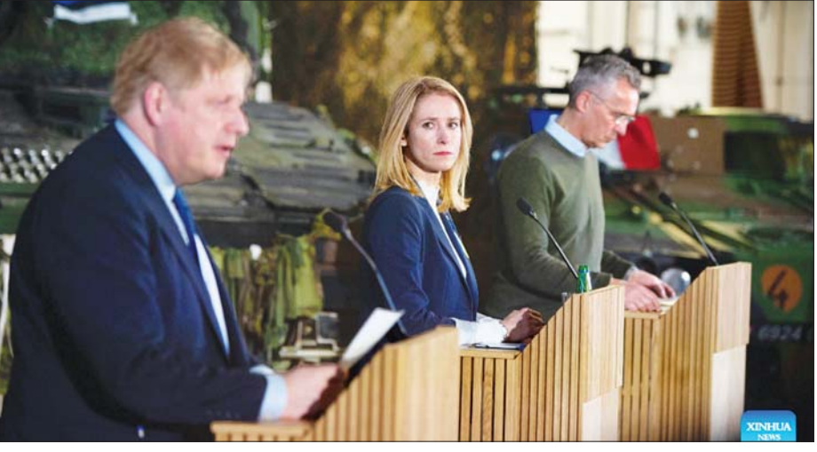
အက်စ်တိုးနီးယား ဝန်ကြီးချုပ် ကာဂျာကယ်လက်စ် (လယ်)၊ နေတိုးအတွင်းရေးမှူးချုပ် ဂျန်စတိုတန်ဘာဂျီ (ယာ) နှင့် ဗြိတိန်ဝန်ကြီးချုပ် ဘောရစ်ဂျွန်ဆင်တို့ အက်စ်တိုးနီးယားမြောက်ပိုင်းရှိ တာပါစစ်အခြေစိုက် စခန်းရှိ ပူးတွဲသတင်းစာရှင်းလင်းပွဲ၌ တွေ့ရစဉ်။

အင်ဒိုနီးရှားနိုင်ငံတွင် ကိုဗစ်-၁၉ ရောဂါ ကူးစက်ဖြစ်ပွားသူပေါင်း ၅၆၃၀၀၉၆ ဦးရှိ