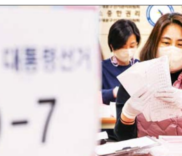
အမျိုးသားရွေးကောက်ပွဲ ကော်မရှင်ရုံးတွင် မဲများကို စစ်ဆေးနေစဉ်။

တွင် ၎င်း၏ သမ္မတသက်တမ်း ကုန်ဆုံးမည်ဖြစ်သည်။ သမ္မတပြိုင်ပွဲတွင် အာဏာရ ဒီမိုကရက်တစ်ပါတီမှ လီဂျေ မြောင်နှင့် အဓိကအတိုက်အခံ ပါတီ ပြည်သူ့အာဏာပါတီမှ ယွန်ဆုခံယော်တို့သည် ရှေ့မှ ပြေးနေသူများဖြစ်သည်။