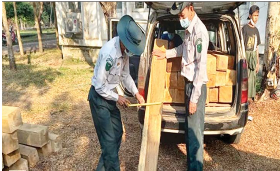
စုစုပေါင်း ခန့်မှန်းတန်ဖိုးငွေကျပ် ၁၆,၁၆၁,၀၀၀ ကို ဖမ်းဆီးရမိခဲ့ပြီး အကောက်ခွန်ဥပဒေနှင့်အညီ အရေးယူဆောင်ရွက်လျက်ရှိသည်။

ထပ်မံ၍ ရှမ်းပြည်နယ် တရားမဝင် ကုန်သွယ်မှုတိုက်ဖျက်ရေး အထူးအဖွဲ့၏ စီမံခန့်ခွဲမှုဖြင့် ချင်းရွှေဟော် ကုန်သွယ်ရေးစခန်း၌ ပူးပေါင်းစစ်ဆေးရေးအဖွဲ့မှ စစ်ဆေးမှုများ ဆောင်ရွက်ခဲ့ရာ တရားမဝင်အားကစားပစ္စည်းများနှင့် လက်ကိုင်ဖုန်းအပိုပစ္စည်းများ (ခန့်မှန်းတန်ဖိုးငွေကျပ် ၃,၁၆၁,၀၀၀) နှင့် အဆိုပါပစ္စည်းများ တင်ဆောင်လာသော မော်တော်ယာဉ်တစ်စီး ခန့်မှန်းတန်ဖိုးငွေကျပ် ၁၃,၀၀၀,၀၀၀