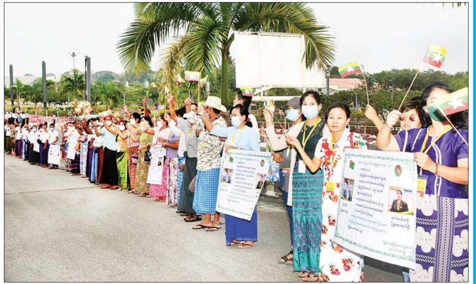
မြန်မာကိုယ်စားလှယ်အဖွဲ့၏ ဆောင်ရွက်မှုကို ထောက်ခံအားပေးကြသည့် နိုင်ငံရေးပါတီများမှ တာဝန်ရှိသူများနှင့် ပြည်သူများက ဗီဒီယိုဆိုင်ဘတ်များကို ကိုင်ဆောင်ကာ သောင်းသောင်းဖြဖြ ကြိုဆိုကြစဉ်။