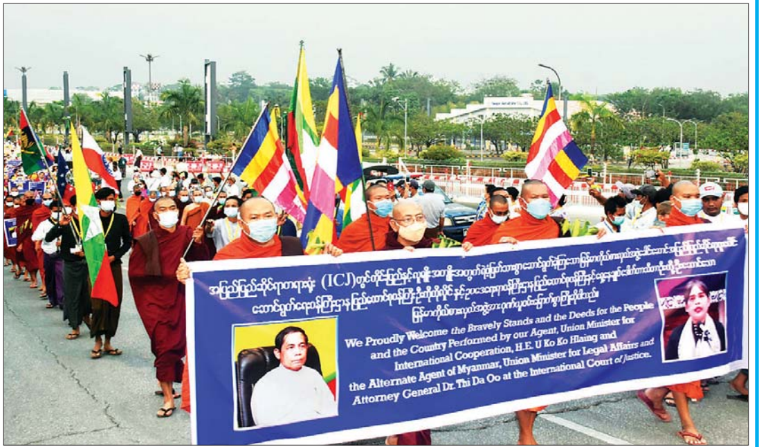
မြန်မာကိုယ်စားလှယ်အဖွဲ့၏ ဆောင်ရွက်မှုကို ထောက်ခံအားပေးကြသည့် ရဟန်းရှင်လူပြည်သူများက သောင်းသောင်းဖြဖြ ကြိုဆိုကြစဉ်။