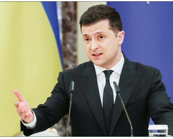
ယူကရိန်းသမ္မတ ဗိုလ်ချုပ်ဗိုလ် ဇီလန်စကီ

ရုရှားနှင့် ယူကရိန်းသည် ၎င်းတို့၏ ပထမဆုံး ညှိနှိုင်းဆွေးနွေးမှုကို ဘယ်လာရုဇ်တွင် ဖေဖော်ဝါရီ ၂၈ ရက်က လုပ်ဆောင်ခဲ့သော်လည်း နှစ်ဖက်အဖွဲ့ များအကြား ရှင်းလင်းသော သဘောတူညီ ချက် မရရှိခဲ့ကြောင်း သိရသည်။ နှစ်ဖက်အဖွဲ့များသည် အမြင်မတူညီ မှုများကို ညှိနှိုင်းဆွေးနွေးမှုမှတစ်ဆင့် ကျဉ်းမြောင်းအောင် ဘယ်လိုလုပ်ဆောင် နိုင်မလဲဆိုသည့်အပေါ် ရှင်းရှင်းလင်းလင်း မသိရသေးချေ။