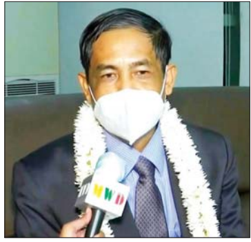
ဦးကိုကိုလှိုင် (ပြည်ထောင်စုဝန်ကြီး)

မြန်မာနိုင်ငံကို အပြည်ပြည်ဆိုင်ရာတရားရုံး(ICJ) ၌ ၁၉၄၈ ခုနှစ် လူမျိုးတုံးစေမှုကို တားဆီးရန်နှင့် ပြစ်ဒဏ်ပေးရန် နိုင်ငံတကာသဘောတူစာချုပ် (Convention on the Prevention and Punishment of the Crime of Genocide) ကို ကျူးလွန်ဖောက်ဖျက်သည်ဟု စွပ်စွဲချက်ဖြင့် တရားစွဲဆိုထားခြင်းနှင့်ပတ်သက်၍ အပြည်ပြည်ဆိုင်ရာပူးပေါင်းဆောင်ရွက်ရေးဝန်ကြီးဌာန ပြည်ထောင်စုဝန်ကြီး ဦးကိုကိုလှိုင်နှင့် ပြည်ထောင်စုရှေ့နေချုပ် ဒေါက်တာသီတာဦးတို့က ဦးဆောင်၍ တက်ရောက်ဖြေရှင်းခဲ့သည့် မြန်မာကိုယ်စားလှယ်အဖွဲ့သည် ယနေ့ညနေပိုင်းတွင် ရန်ကုန်အပြည်ပြည်ဆိုင်ရာလေဆိပ်သို့ ပြန်လည်ရောက်ရှိလာရာ ပြည်သူများမှ သောင်းသောင်းဖြဖြ ကြိုဆိုခဲ့ကြပြီး ပြည်သူများ၏ စကားသံများကို ဖော်ပြပေးလိုက်ပါသည်။