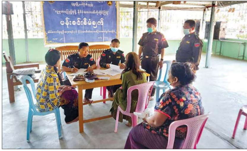
ထို့အပြင် ပန်းခင်းစီမံချက်ဖြင့် နိုင်ငံသားစိစစ်ရေးကတ်ပြုလုပ်ရန်အတွက် မြို့နယ်ဦးစီးမှူးရုံးတွင် မုံရွာမြို့နယ်အတွင်း ကြိုးကြာကန်ကျေးရွာအုပ်စုမှ ဖိတ်ခေါ်ထားသော ပြည်သူ ၂၀ အား နေ့ချင်းပြီးဆောင်ရွက်ပေးလျက်ရှိကြောင်းနှင့် မုံရွာမြို့နယ်အတွင်းရှိ ပြည်သူများအနေဖြင့်လည်း ပန်းခင်းစီမံချက်ဖြင့်နိုင်ငံသား စိစစ်ရေးကတ်ပြုလုပ်ဆောင်ရွက်လိုပါက ရပ်ကွက် ကျေးရွာအုပ်ချုပ်ရေးမှူးမှတစ်ဆင့် ချိတ်ဆက်ပြီး မြို့နယ်ရုံးသို့ လာရောက်ပြုလုပ်နိုင်ကြောင်း သိရသည်။ ခရိုင်(ပြန်/ဆက်)

မုံရွာ မတ် ၂ လူဝင်မှုကြီးကြပ်ရေးနှင့် ပြည်သူ့အင်အားဝန်ကြီးဌာန မုံရွာမြို့နယ်ဦးစီးမှူးရုံးသည် ပြည်သူများ နိုင်ငံသားစိစစ်ရေးကတ်များ ရရှိရေးအတွက် ပန်းခင်းစီမံချက်ဖြင့် မတ် ၁ ရက်က မုံရွာမြို့နယ် နန္ဒဝန်ရပ်ကွက်သန္တဝါဒီ ဘုန်းတော်ကြီးကျောင်း၌ ကွင်းဆင်းဆောင်ရွက်ပေးသည်။