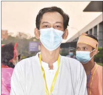
အမျိုးသားရေးဆောင်ရွက်နေသည့် ပြည်သူတစ်ဦး

မတရားသဖြင့် တရားစွဲခဲ့တာကို ပြည်ပ အဖွဲ့အစည်းတွေက အထောက်အပံ့တွေ ပေးပြီး မတရားအမှုဖွင့်ခဲ့ကြတယ်။ ဒါတွေ ကို ပယ်ဖျက်နိုင်အောင် မြန်မာနိုင်ငံရဲ့ သူရဲကောင်းတွေဖြစ်တဲ့ ဆရာဦးကိုကိုလှိုင် နဲ့ ဆရာမ ဒေါ်သီတာဦးတို့က သွားရောက် ဖြေရှင်းခဲ့တယ်။ ကမ္ဘာ့အလယ်မှာ ကျွန်တော်တို့မြန်မာနိုင်ငံက အပြစ်မရှိဘူး ဆိုတာ သိသင့်သလောက် သိရှိသွားပြီ။ ဒါကြောင့် ကျွန်တော်တို့နိုင်ငံရဲ့ သူရဲ ကောင်းတွေကို ကြိုဆိုတာပါ။ ကြိုလည်း ကြိုဆိုသင့်ပါတယ်။ ကျွန်တော်တို့နိုင်ငံက တိုင်းရင်းသားတွေကို ဒုက္ခပေးတုန်း ကတော့ သူတို့စတင်လုပ်ဆောင်ခဲ့ကြ တာပါ။ ကျွန်တော်တို့နိုင်ငံမှာမရှိတဲ့ လူမျိုး ကို အရှိလုပ်ပြီး မတရားဆောင်ရွက်ခဲ့ တယ်။ ဒီအတွက် တိုင်းရင်းသားတွေ