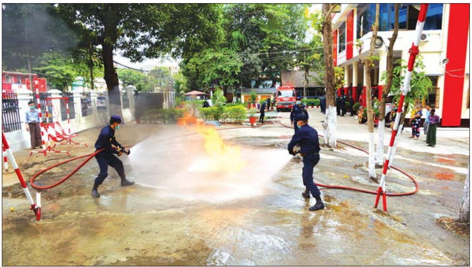
တာမွေမြို့နယ် အရန်မီးသတ်တပ်ဖွဲ့ဝင်များအား မီးငြိမ်းသတ်ရေး လေ့ကျင့်သင်ကြားပေးနေစဉ်။

မီးလောင်မှုအမျိုးအစားများကို ခွဲခြမ်းစိတ်ဖြာ ကြည့်လျှင် တောမီး၊ ရှိုမီး၊ ဖယောင်းတိုင်မီး၊ လျှပ်စစ်ပိုင်းယာရှော့မီး၊ မီးဖိုမီး စသည်ဖြင့် တွေ့ရ မည်ဖြစ်ပါသည်။ ထိုမီးများအနက် ကြောက်စရာ အကောင်းဆုံးသောမီးမှာ ပေါ့ဆမီးဖြစ်သည်။ မီးကို ပေါ့ပေါ့ဆဆအသုံးပြုမှုကြောင့် ဖြစ်ပွားရသော မီးလောင်မှုဖြစ်သည်။ ပေါ့ဆသည်ဟုဆိုရာတွင် လည်း သတိလက်လွတ်အသုံးပြုရာမှ မထင်မှတ်ဘဲ မီးလောင်ခြင်းဖြစ်သည်။ မီးလောင်ခြင်း၏ အဓိကအကြောင်းအရင်းသည် ပေါ့ဆမှုကြောင့်သာ ဖြစ်ပါသည်။