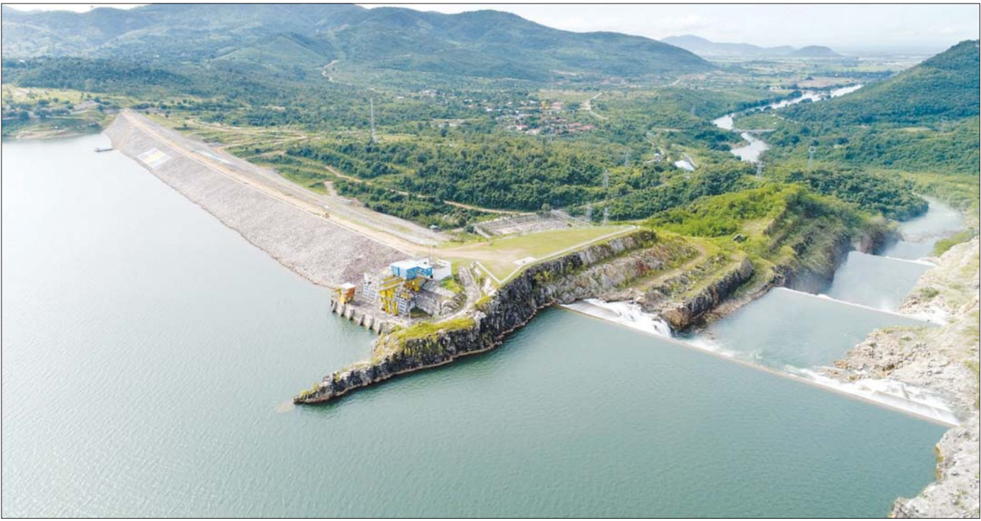
ပေါင်းလောင်းရေလှောင်တံခံကို တွေ့ရစဉ်။

ထိုကဲ့သို့ သုတေသနလုပ်ငန်းစီမံကိန်းများကို ဆောင်ရွက်ရာတွင် လယ်သမားများ၏ လယ်ယာ လုပ်ငန်းဆိုင်ရာ၊ ပိုင်ဆိုင်မှုဆိုင်ရာ၊ သီးနှံစိုက်ပျိုးမှု ကုန်ကျစရိတ်နှင့် သီးနှံထွက်နှုန်းဆိုင်ရာ၊ ဆည် ရေပေးဝေမှု သုံးစွဲမှုနှင့် သက်ဆိုင်သည့် လယ်သမား များ၏ လယ်ယာလုပ်ငန်းဆောင်ရွက်မှုဆိုင်ရာ အချက်အလက်များကို ရယူဆောင်ရွက်လျက်ရှိ