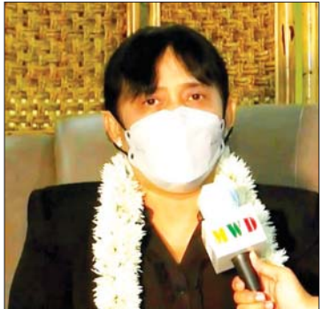
ဒေါက်တာသီတာဦး (ပြည်ထောင်စုရှေ့နေချုပ်)

ဦးကိုကိုလှိုင်(ပြည်ထောင်စုဝန်ကြီး) ကျွန်တော်တို့အနေနဲ့ကတော့ ခုလို တိုင်းပြည်အတွက် တစ်တပ်တစ်အား ICJ သည်ဟိဂ်မြို့မှာ သွားပြီး အစွမ်းကုန် ကြိုးစားဆောင်ရွက်ခဲ့ပြီးတော့ တိုင်းပြည် ရဲ့ အချုပ်အခြာအာဏာနဲ့ ပြည်သူတွေရဲ့ အမျိုးသားအကျိုးစီးပွားကို အတတ်နိုင် ဆုံး ကြိုးစားပြီး ကာကွယ်ခဲ့ပါတယ်။ အဲဒီလိုဆောင်ရွက်နေတဲ့အချိန်မှာလည်းပဲ တစ်နိုင်လုံးကိုင်ပြီးထောက်ခံအားပေး ကြပါတယ်။ အဲဒီလို အားပေးထောက်ခံ ကြတဲ့ ပြည်သူတွေရဲ့ လက်ခုပ်သံကို ကြားရတဲ့အခါ ကျွန်တော့်အနေနဲ့ အများကြီး အားရှိခဲ့ပါတယ်။ ခုလည်းပဲ ဒီလိုမျိုး အများကြီးလာပြီး ကြိုဆိုကြ တယ်။ သောင်းသောင်းဖြဖြ ထောက်ခံ အားပေးကြတယ်ဆိုတဲ့အခါ တကယ် လည်း ကျွန်တော့်အနေနဲ့ ဝမ်းသာပါတယ်။ အတိုင်းထက်အလွန်ကိုပဲ ပိုပြီးဆက်လုပ် ဖို့အတွက် အားရှိသွားပါတယ်လို့ ပြောချင် ပါတယ်။