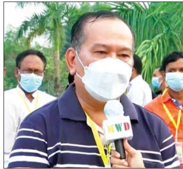
ပြည်သူတစ်ဦး

နယ်သာလန်မှာသွားပြီး ဖြေရှင်းပါတယ်။ ဖြေရှင်းတဲ့အပေါ်မှာ ဖြေကြားခြင်းများကို ပြည်သူတွေ သိရှိပြီးဖြစ်ပါလိမ့်မယ်။ ကျွန်တော်တို့တွေသည် ဥပဒေကြောင်း အရမှာ တင်စွဲလာခြင်းကို လေးလေး စားစားနဲ့ နိုင်ငံတကာက ပြဋ္ဌာန်းထားတဲ့