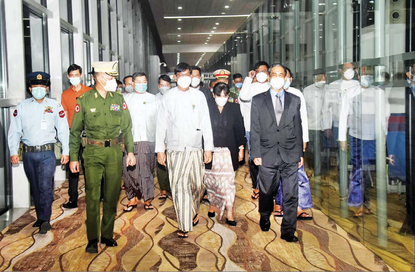
ကနဦးကန့်ကွက်လွှာဆိုင်ရာ ကြားနာပွဲသို့ တက်ရောက်ခဲ့သည့် ပြည်ထောင်စုဝန်ကြီး ဦးကိုကိုလှိုင်နှင့် ဒေါက်တာသီတာဦးတို့ ဦးဆောင်သော အဖွဲ့အား ရန်ကုန်အပြည်ပြည်ဆိုင်ရာလေဆိပ်၌ ရန်ကုန်တိုင်းဒေသကြီးဝန်ကြီးချုပ် ဦးစိုးသိန်း၊ ရန်ကုန်တိုင်းစစ်ဌာနချုပ် တိုင်းမှူး ဗိုလ်ချုပ် ညွန့်ဝင်းဆွေ၊ နိုင်ငံခြားရေးဝန်ကြီးဌာန ဒုတိယဝန်ကြီး ဦးကျော်မျိုးထွဋ်၊ တိုင်းဒေသကြီးဝန်ကြီးများနှင့် ဌာနဆိုင်ရာတာဝန်ရှိသူများက ကြိုဆိုကြစဉ်။

ရန်ကုန် မတ် ၂ နယ်သာလန်နိုင်ငံ သည်ဟိဂ်မြို့ရှိ အပြည်ပြည်ဆိုင်ရာတရားရုံး(ICJ)၌ မြန်မာနိုင်ငံက တင်သွင်းခဲ့သော ကနဦးကန့်ကွက်လွှာဆိုင်ရာ ကြားနာပွဲသို့ တက်ရောက်ခဲ့သည့် အပြည်ပြည်ဆိုင်ရာ ပူးပေါင်းဆောင်ရွက်ရေးဝန်ကြီးဌာန ပြည်ထောင်စုဝန်ကြီးဦးကိုကိုလှိုင်နှင့် ဥပဒေရေးရာဝန်ကြီးဌာန ပြည်ထောင်စုဝန်ကြီးနှင့် ပြည်ထောင်စုရှေ့နေချုပ် ဒေါက်တာသီတာဦးတို့ ဦးဆောင်သော မြန်မာကိုယ်စားလှယ်အဖွဲ့သည် ယနေ့ညပိုင်းတွင် လေကြောင်းခရီးဖြင့် ရန်ကုန်မြို့သို့ ပြန်လည်ရောက်ရှိကြသည်။ ပြည်ထောင်စုဝန်ကြီး ဦးကိုကိုလှိုင်နှင့် ဒေါက်တာ သီတာဦးတို့ ဦးဆောင်သော မြန်မာကိုယ်စားလှယ်အဖွဲ့အား ရန်ကုန်တိုင်းဒေသကြီးဝန်ကြီးချုပ် ဦးစိုးသိန်း၊ ရန်ကုန်တိုင်းစစ်ဌာနချုပ် တိုင်းမှူး ဗိုလ်ချုပ် ညွန့်ဝင်းဆွေ၊ နိုင်ငံခြားရေးဝန်ကြီးဌာန ဒုတိယဝန်ကြီးဦးကျော်မျိုးထွဋ်၊ တိုင်းဒေသကြီးဝန်ကြီးများနှင့် ဌာနဆိုင်ရာ တာဝန်ရှိသူများက ရန်ကုန်အပြည်ပြည်ဆိုင်ရာလေဆိပ်၌ ကြိုဆိုနှုတ်ဆက်ကြသည်။ ထို့ပြင် မြန်မာကိုယ်စားလှယ်အဖွဲ့၏ ဆောင်ရွက်မှုကို ထောက်ခံအားပေးကြသည့် နိုင်ငံရေးပါတီများမှ တာဝန်ရှိသူများ၊ မြန်မာနိုင်ငံ ဘာသာပေါင်းစုံချစ်ကြည်ညီညွတ်ရေးအဖွဲ့ (ဗဟို)မှ တာဝန်ရှိသူများ၊ ဗုဒ္ဓဘာသာကလျာဏယုဝအသင်းကြီး (YMBA) (ဗဟို)မှ တာဝန်ရှိသူများ၊ ဌာနဆိုင်ရာဝန်ထမ်းများနှင့် စာမျက်နှာ ၅ ကော်လံ ၁ ❖