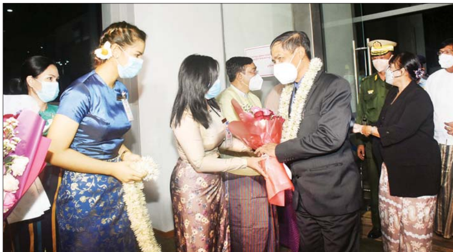
ကနဦးကန့်ကွက်လွှာဆိုင်ရာ ကြားနာပွဲသို့ တက်ရောက်ခဲ့သည့် ပြည်ထောင်စုဝန်ကြီး ဦးကိုကိုလှိုင်နှင့် ဒေါက်တာ သီတာဦးတို့ ဦးဆောင်သောအဖွဲ့အား ရန်ကုန်အပြည်ပြည်ဆိုင်ရာလေဆိပ်၌ ပြည်သူများက ကြိုဆိုနှုတ်ဆက်ကြစဉ်။