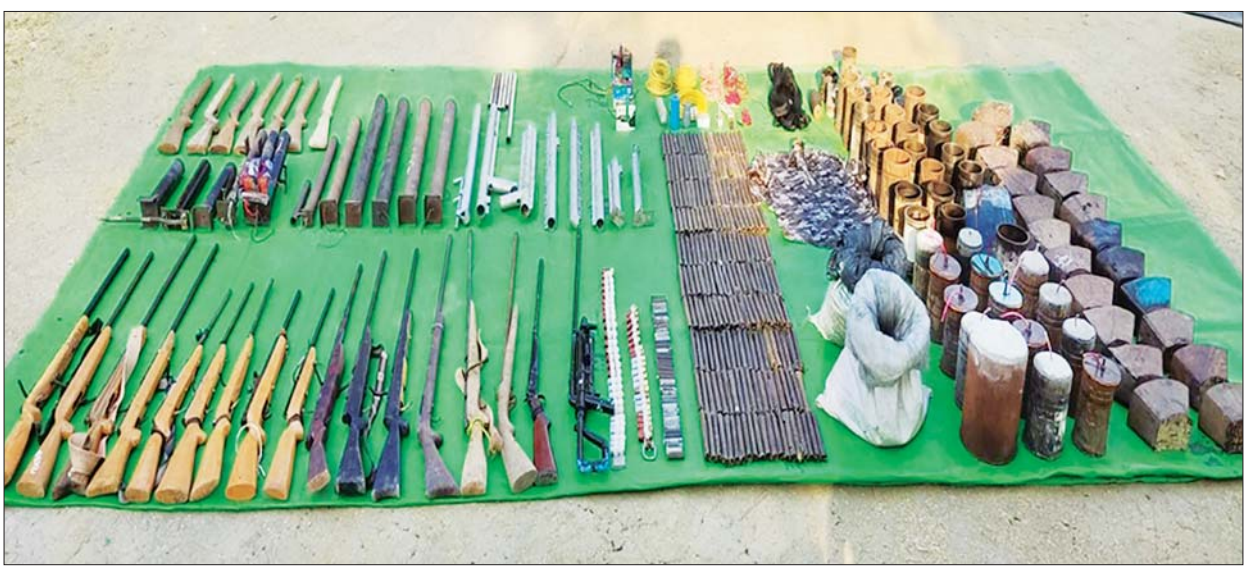
စစ်ကိုင်းတိုင်းဒေသကြီး ဝက်လက်မြို့နယ် ကျောက်တိုင်ကျေးရွာအတွင်း သိမ်းဆည်းရမိသည့် PDF အမည်ခံအကြမ်းဖက်သမားများ၏ လက်နက်ခဲယမ်းများ၊ လက်လုပ်ခိုင်းနှင့် ဆက်စပ်ပစ္စည်းများအား တွေ့ရှိရစဉ်။

မတ် ၂ ရက် ည ၈ နာရီ ထုတ်ပြန်ချက်အရ ကိုဗစ်-၁၉ ရောဂါ ဓာတ်ခွဲအတည်ပြုလူနာသစ် ၁၉၀၂ ဦး တွေ့ရှိ