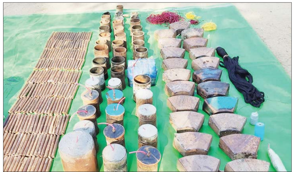
စစ်ကိုင်းတိုင်းဒေသကြီး ဝက်လက်မြို့နယ် ကျောက်တိုင်ကျေးရွာအတွင်း သိမ်းဆည်းရမိသည့် PDF အမည်ခံအကြမ်းဖက်သမားများ၏ လက်လုပ်မိုင်းနှင့် ဆက်စပ်ပစ္စည်းများအား တွေ့ရှိရစဉ်။