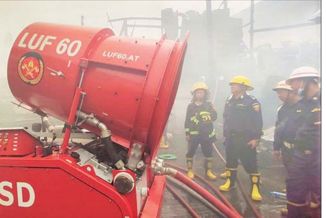
ဖေဖော်ဝါရီ ၂၈ ရက်က လှိုင်သာယာမြို့နယ် စက်မှုဇုန်(၄)ရုံ အထည်ချုပ်စက်ရုံ မီးလောင်မှုကို မီးသတ် တပ်ဖွဲ့ဝင်များက ဖြိုခွဲသတ်နေစဉ်။