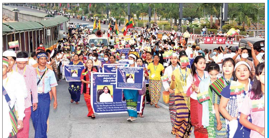
မြန်မာကိုယ်စားလှယ်အဖွဲ့၏ဆောင်ရွက်မှုကို ထောက်ခံအားပေးကြသည့် ပြည်သူများက ဗီဒီယိုဆိုင်ဘတ်များကို ကိုင်ဆောင်ကာ သောင်းသောင်းဖြဖြ ကြိုဆိုကြစဉ်။