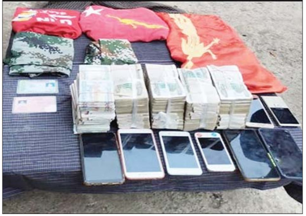
၁၃-၂-၂၀၂၂ ရက်က တောင်ကြီးမြို့နယ် အေးသာယာမြို့ ရပ်ကွက်(၁၂) ၌ တရားခံနှင့်အတူ သိမ်းဆည်းရမိသည့်ပစ္စည်းများ၏ မှတ်တမ်းဓာတ်ပုံ။