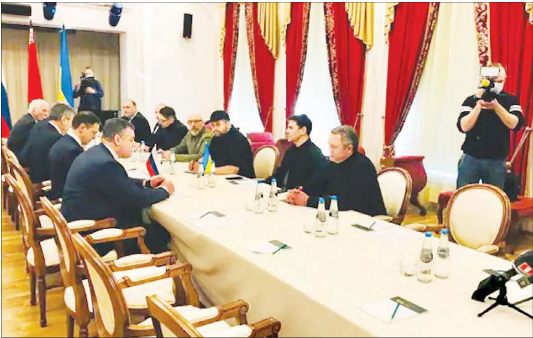
ဖေဖော်ဝါရီ ၂၈ ရက်က ဘီလာရစ်၌ ရုရှားနှင့် ယူကရိန်းကိုယ်စားလှယ်အဖွဲ့ ဆွေးနွေးစဉ်။

ဒီအရေးနဲ့ ပတ်သက်ပြီးတော့ အမေရိကန်ဘက်က နျူကလီးယားတပ်ဖွဲ့ဝင်တွေကို တပ်လှန့်ထားခြင်း ရှိ မရှိတော့ သူက မပြောခဲ့ပါဘူး။ ဒါပေမယ့် ကိုယ့်ကိုယ်ကိုယ် ကာကွယ်နိုင်တဲ့ မိမိတို့ရဲ့ စွမ်းပကားနဲ့ မိမိတို့ရဲ့ မဟာမိတ် စွမ်းပကားတွေကို အပြည့်အဝ ယုံကြည်တယ်လို့ အမေရိကန်ကာကွယ်ရေး အရာရှိတစ်ဦးက ပြောကြားခဲ့ပါတယ်။ ရုရှားဟာ အခုဆိုရင် ယူကရိန်းနယ်စပ်မှာ တပ်စွဲထားတဲ့ အမာခံတပ်ဖွဲ့ဝင် ၁၅၀၀၀၀ ရဲ့ သုံးပုံနှစ်ပုံ လောက်ကို ဖြန့်ကြက်ထားပါတယ်။ သို့သော်လည်း ပင်တဂွန်က ရရှိထားတဲ့ သတင်း အချက်အလက်တွေအရ ရုရှားတပ်ဖွဲ့တွေဟာ ယူကရိန်းရှေ့တန်း