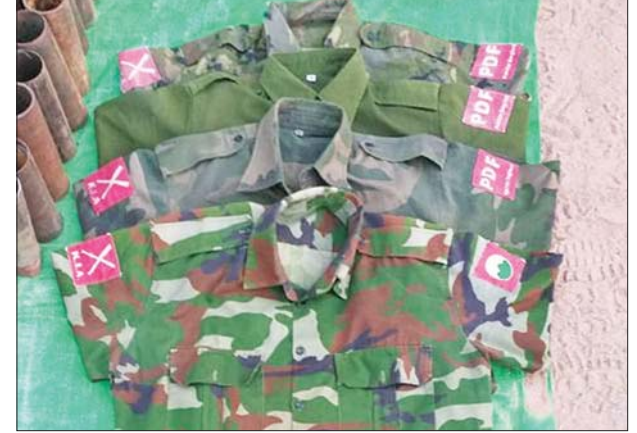
ကျွန်းလှမြို့နယ် ဝေလမူကျေးရွာအတွင်းနှင့် ကျေးရွာအနီးတစ်ဝိုက်၌ ရောက်ရှိခိုအောင်းနေသည့် PDF အမည်ခံအကြမ်းဖက်သမားများနှင့် ထိတွေ့မှုဖြစ်စဉ်မှ သိမ်းဆည်းရမိသည့် KIA/PDF လက်မောင်းတံဆိပ် ပါ ပြောက်ကျားယူနီဖောင်းများအား တွေ့ရစဉ်။

စွာအရေးယူနိုင်ရေး ဆက်လက် လုပ်ငန်းများကို ပြည်သူလူထု ဆောင်ရွက်သွားမည်ဖြစ်ကြောင်း တို့နှင့်အတူ ပူးပေါင်း၍ ဆက်လက် နှင့် လုံခြုံရေးတပ်ဖွဲ့ဝင်များအနေ ဆောင်ရွက်သွားမည်ဖြစ်ကြောင်း ဖြင့် အကြမ်းဖက်မှုနှိမ်နင်းရေး သတင်းရရှိသည်။ သတင်းစဉ်