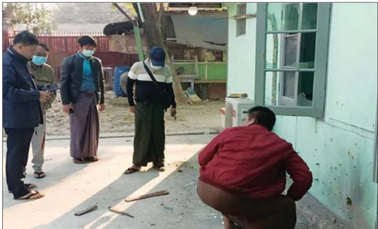
၅-၁၀-၂၀၂၁ ရက်က စဉ့်ကိုင်မြို့နယ် ရွာဘိုကျေးရွာ ရွာလယ် ဘုန်းကြီးကျောင်းအား လက်လုပ်ဗုံးဖြင့် ပစ်ခတ်ခံရသည့် မှတ်တမ်းဓာတ်ပုံ။