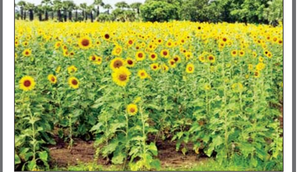
ဆောင်းပါး စာ - ၆