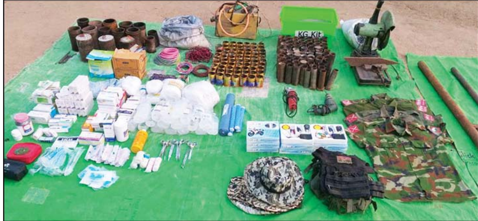
ကျွန်းလှမြို့နယ် ဝေလမူကျေးရွာအတွင်းနှင့် ကျေးရွာအနီးတစ်ဝိုက်၌ ရောက်ရှိခိုအောင်းနေသည့် PDF အမည်ခံအကြမ်းဖက်သမားများနှင့် ထိတွေ့မှုဖြစ်စဉ်မှ သိမ်းဆည်းရမိသည့် လက်နက်ခဲယမ်းများနှင့် ဆက်စပ်ပစ္စည်းများ၊ ဆေးမျိုးစုံတို့ကို တွေ့ရစဉ်။

လုံးနှင့် မိုင်းနှင့် လက်လုပ်သေနတ် ပြုလုပ်ရာတွင် အသုံးပြုသည့် ဆက်စပ်ပစ္စည်းများ၊ လမ်းလျှောက် စကားပြောစက် သုံးလုံး၊ KIA/PDF လက်မောင်းတံဆိပ်ပါ ပြောက် ကျား ယူနီဖောင်း သုံးထည်၊ PDF လက်မောင်းတံဆိပ်ပါ ယူနီဖောင်း တစ်စုံနှင့် ဆေးမျိုးစုံနှစ်ဖာတို့ကို သိမ်းဆည်းရမိခဲ့သည်။ အကြမ်းဖက်သမားများ အနေ ဖြင့် ယခုကဲ့သို့ စစ်ရေးနှင့် သက်ဆိုင်သည့် ပစ်မှတ်များ မဟုတ်သော ဘာသာရေး၊ ပညာ ရေးဆိုင်ရာ အဆောက်အဦများနှင့် လူနေအိမ်များကို အကာအကွယ် ရယူ ပစ်ခတ်တိုက်ခိုက်ခြင်း၊ စခန်းချအခြေပြု အကာအကွယ် ယူတိုက်ခိုက်ခြင်းသည် ဂျီနီဗာ ကွန်ဗင်းရှင်းနှင့် အပြည်ပြည် ဆိုင်ရာဥပဒေတို့အရ စစ်ရာဇဝတ် မှု ကျူးလွန်ရာရောက်ပြီး အဆိုပါ ရာဇဝတ်မှုများအတွက် အကြမ်း ဖက်မှုတိုက်ဖျက်ရေး ဥပဒေ ရာဇဝတ်ကြီးနှင့် သက်ဆိုင်ရာ တည်ဆဲဥပဒေများဖြင့် ထိရောက်