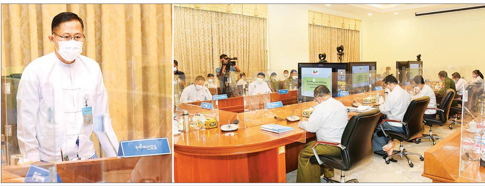
နိုင်ငံတော်စီမံအုပ်ချုပ်ရေးကောင်စီ ဒုတိယဥက္ကဋ္ဌ ဒုတိယဝန်ကြီးချုပ် ဒုတိယဗိုလ်ချုပ်မှူးကြီး စိုးဝင်း ၂၀၂၂ ခုနှစ် (၇၄) နှစ်မြောက် လွတ်လပ်ရေးနေ့ ကျင်းပခဲ့မှုနှင့် စပ်လျဉ်း၍ ပြန်လည်သုံးသပ်သည့် ညှိနှိုင်းအစည်းအဝေးတွင် အမှာစကားပြောကြားစဉ်။

နေပြည်တော် မတ် ၁ ၂၀၂၂ ခုနှစ် (၇၄)နှစ်မြောက် လွတ်လပ်ရေးနေ့ ကျင်းပခဲ့မှုနှင့် စပ်လျဉ်း၍ ပြန်လည်သုံးသပ်သည့် ညှိနှိုင်းအစည်းအဝေးကို ယနေ့မွန်းလွဲပိုင်းတွင် နိုင်ငံတော်စီမံအုပ်ချုပ်ရေး ကောင်စီရုံး အစည်းအဝေးခန်းမ၌ ကျင်းပရာ (၇၄) နှစ်မြောက်လွတ်လပ်ရေးနေ့ ကျင်းပရေး ဗဟိုကော်မတီဥက္ကဋ္ဌ နိုင်ငံတော် စီမံအုပ်ချုပ်ရေးကောင်စီ ဒုတိယဥက္ကဋ္ဌ ဒုတိယဝန်ကြီးချုပ် ဒုတိယဗိုလ်ချုပ်မှူးကြီး စိုးဝင်း တက်ရောက်အမှာစကား ပြောကြားသည်။ စာမျက်နှာ ၄ ကော်လံ ၁*