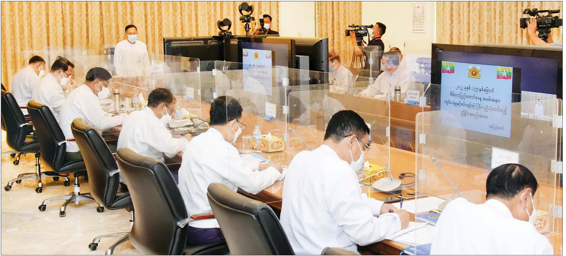
နိုင်ငံတော်စီမံအုပ်ချုပ်ရေးကောင်စီဒုတိယဥက္ကဋ္ဌ ဒုတိယဝန်ကြီးချုပ် ဒုတိယဗိုလ်ချုပ်မှူးကြီး စိုးဝင်း (၇၅) နှစ်မြောက် စိန်ရတုပြည်ထောင်စုနေ့ အခမ်းအနားကျင်းပခဲ့မှုနှင့်စပ်လျဉ်း၍ ပြန်လည်သုံးသပ်သည့် ညှိနှိုင်းအစည်းအဝေးတွင် အမှာစကားပြောကြားစဉ်။