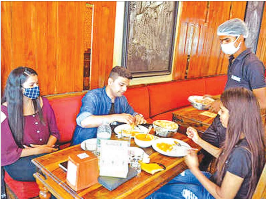
စားသောက်ဆိုင်တွင် ဆိုင်ထိုင်စားသောက်နေကြသူများကို တွေ့ရစဉ်။

နာခေါင်းစည်းတစ်စရာမလို ဖေဖော်ဝါရီ ၂၇ ရက်က နယူးဒေလီတွင် နေ့စဉ်ကူးစက်ခံ ရသူ ၄၈၄ ဦး တွေ့ရှိခဲ့သည်။ မြို့တော်အတွင်းရှိ စားသောက် ဆိုင်များမှာ ယခုအခါ လူဦးရေ ကန့်သတ်ချက်မရှိဘဲ ဖွင့်လှစ်နိုင် ဖြစ်သည်။ ကိုယ်ပိုင်သီးသန့်