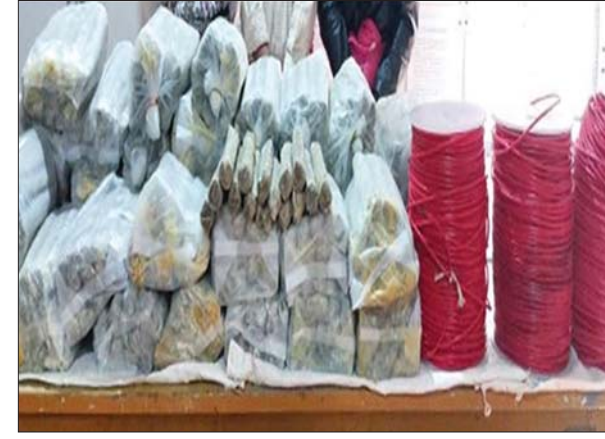
၂၅-၂-၂၀၂၂ ရက်က ပုသိမ်ကြီးမြို့နယ် ထုံးဘိုကျေးရွာတွင် သိမ်းဆည်းရမိသည့် ဖောက်ခွဲရေးဆက်စပ်ပစ္စည်းများ၏ မှတ်တမ်း ဓာတ်ပုံ။