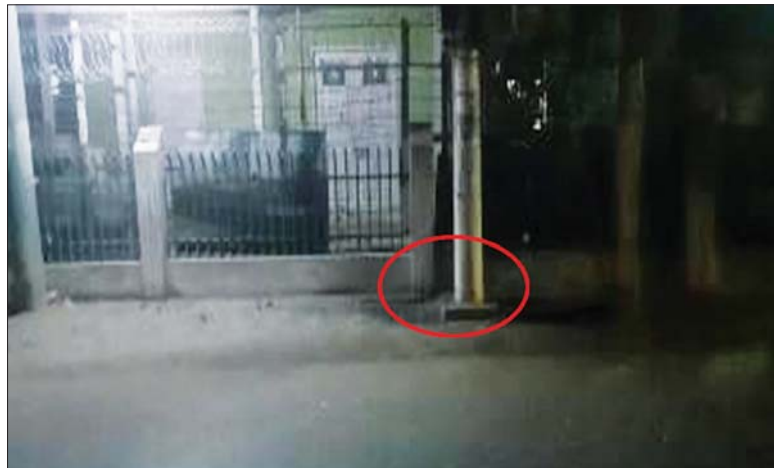
၂၃-၅-၂၀၂၁ ရက်က စဉ့်ကိုင်မြို့နယ် ပလိပ်မြို့ ဝန်ထမ်းကွက်သစ်ရပ်ကွက်နေ အပြစ်မဲ့ပြည်သူတစ်ဦး၏ နေအိမ်အား လက်လုပ်ဗုံးဖြင့် ပစ်ခတ်ခံရသည့် မှတ်တမ်း ဓာတ်ပုံ။

ကျေးရွာအနီးနှင့် သမန်းစာ သင်တန်းများ ပြန်လည်ပို့ချခဲ့ ကျေးရွာအနီးတို့တွင် ဆင့်ပွား ကြောင်း ဖော်ထုတ်သိရှိရသည်။