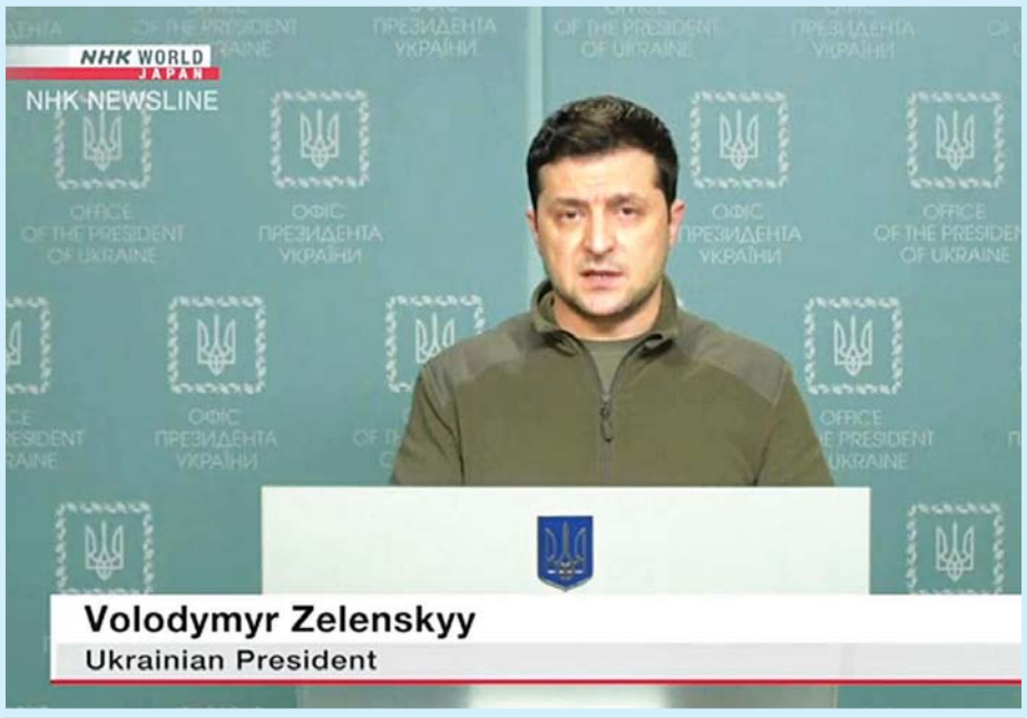
ယူကရိန်းသမ္မတ ဗိုလ်ချုပ် ဖီလစ်ရှင်