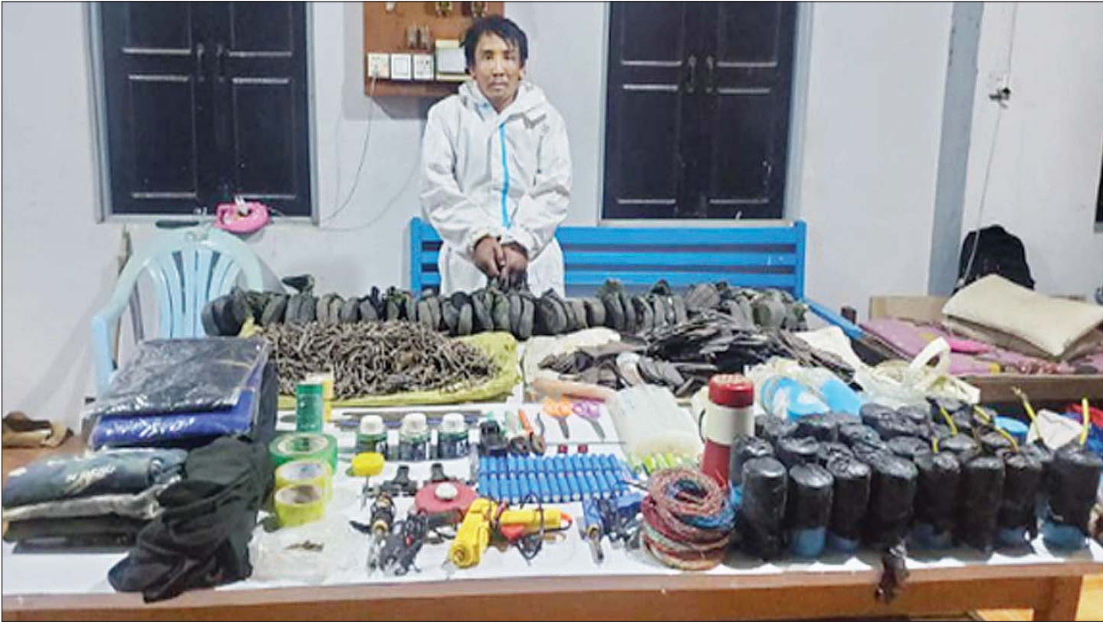
၂၀၂၂ ခုနှစ် ဖေဖော်ဝါရီ ၁၈ ရက်တွင် မြစ်သားမြို့နယ် ဒရယ်ကောင်းကျေးရွာအနီးရှိ ကျောက်ဆည် PDF အကြမ်းဖက်အဖွဲ့စခန်းနေရာမှ သိမ်းဆည်းရမိသည့် ဖောက်ခွဲရေးဆက်စပ်ပစ္စည်းများ၏ မှတ်တမ်းဓာတ်ပုံ။