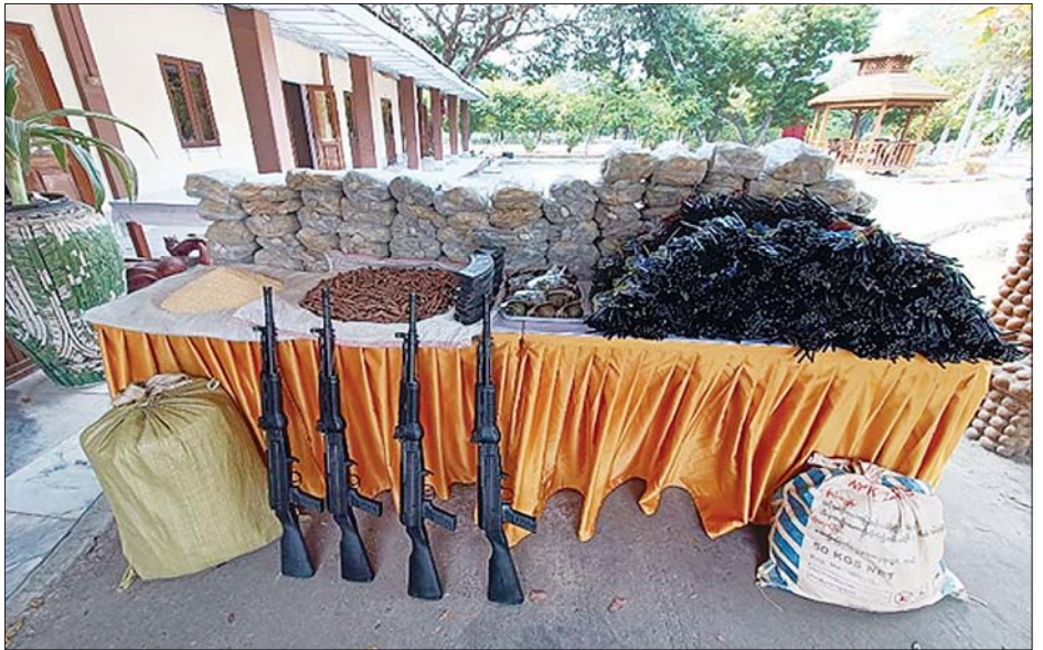
၂၁-၂-၂၀၂၂ ရက်က ကျောက်ဆည်မြို့နယ် ဟန်မြင့်မိုရ်ကျေးရွာအနီး၌ သိမ်းဆည်းရမိသည့် လက်နက်/ ခဲယမ်းများ၏ မှတ်တမ်းဓာတ်ပုံ။

ကျေးရွာအနီးနှင့် သမန်းစာ သင်တန်းများ ပြန်လည်ပို့ချခဲ့ ကျေးရွာအနီးတို့တွင် ဆင့်ပွား ကြောင်း ဖော်ထုတ်သိရှိရသည်။