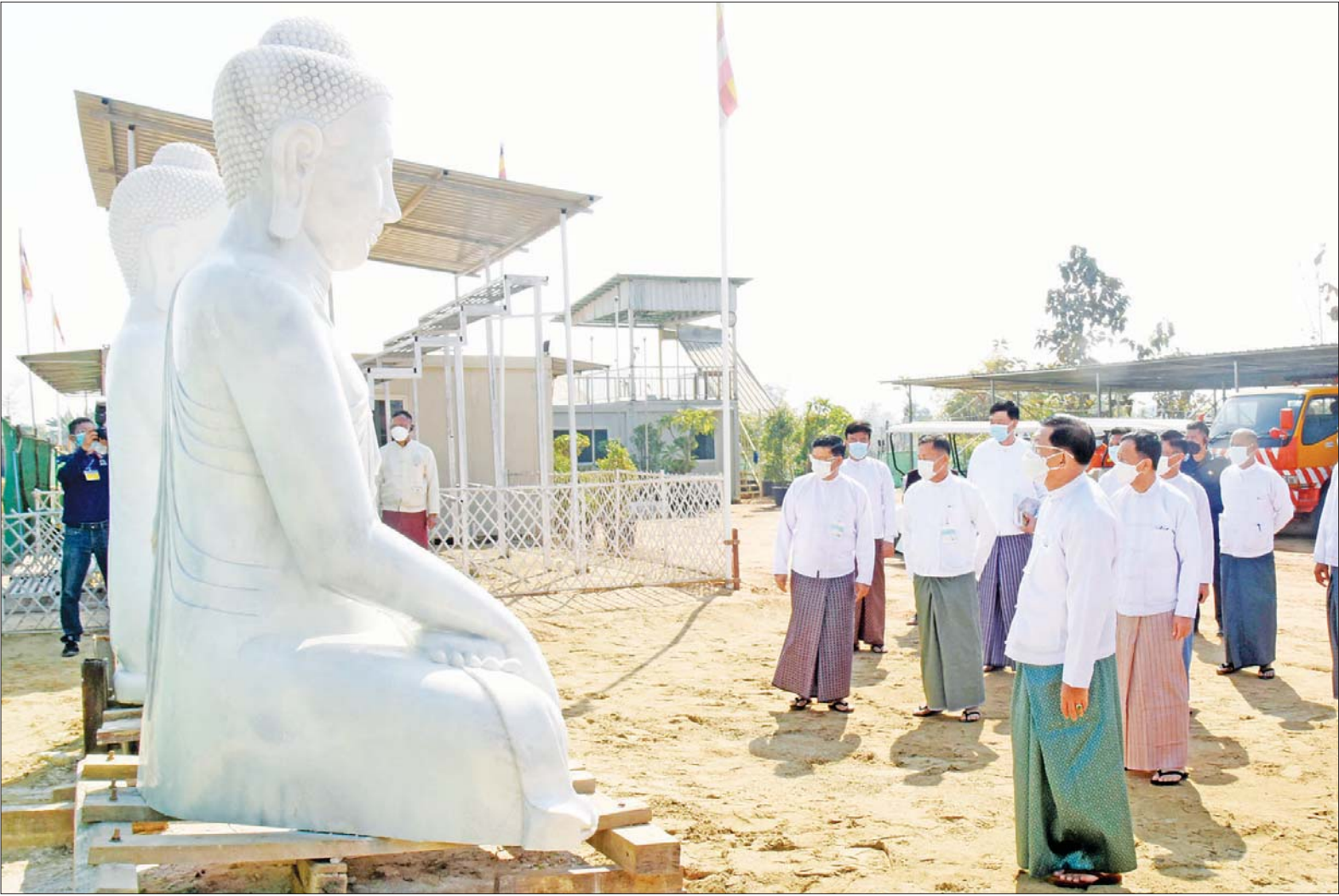
နိုင်ငံတော်စီမံအုပ်ချုပ်ရေးကောင်စီဥက္ကဋ္ဌ နိုင်ငံတော်ဝန်ကြီးချုပ် ဗိုလ်ချုပ်မှူးကြီး မင်းအောင်လှိုင်နှင့် အဖွဲ့ဝင်များ ဉာဏ်တော်ကိုးပေရှိ ဆင်းတုတော်များကို CNC စက်ဖြင့် ထုဆစ်ထားရှိမှုအခြေအနေများအား ကြည့်ရှုစစ်ဆေးစဉ်။

ယင်းနောက် ရှင်းလင်းဆောင် ဌ် ကာကွယ်ရေးဦးစီးချုပ်ရုံး (ကြည်း)မှ ဒုတိယဗိုလ်ချုပ်ကြီး ကျော်စွာလင်းနှင့် ဒုတိယ ဗိုလ်ချုပ်ကြီး ကမြင့်သန်းတို့က မာရဝိဇယ ဗုဒ္ဓရုပ်ပွားတော်မြတ် ကြီး တည်ထားကိုးကွယ်ရေး လုပ်ငန်းများ တိုးတက်မှုအခြေ အနေနှင့် ဆက်လက်ဆောင်ရွက် လျက်ရှိသည့် အခြေအနေများကို ရှင်းလင်းတင်ပြရာ နိုင်ငံတော် စီမံအုပ်ချုပ်ရေးကောင်စီ ဥက္ကဋ္ဌ နိုင်ငံတော်ဝန်ကြီးချုပ်က သစ်ပင် များအား မိုးမကျမီ အပြီးစိုက်ပျိုး ရန်၊ မြန်မာမှုလက်ရာများကို စနစ် တကျဖြစ်စေရေး ရှေးမူလက်ရာ များအားလေ့လာ၍ ဆောင်ရွက်ရန်၊ လုပ်ငန်းများ စနစ်တကျ ပြီးစီးစေ ရေး ဆောင်ရွက်ရန်နှင့် အခြား စာမျက်နှာ ၅ သို့