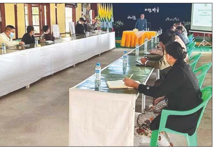
ပြည်ထောင်စုရွေးကောက်ပွဲကော်မရှင်အဖွဲ့ဝင် ဦးသန်းစိုး အမှာစကားပြောကြားစဉ်။

ဆန္ဒရှင်စာရင်းများ ကြိုတင်ပြုစုရာတွင် ဌာနဆိုင်ရာများအားလုံး ပူးပေါင်းပါဝင် ကူညီဆောင်ရွက်လျက်ရှိပြီး အခက်အခဲ မရှိကြောင်းနှင့် မြို့နယ်ဆေးရုံအုပ် ဒေါက်တာမျိုးအောင်က ကိုဗစ်-၁၉ ရောဂါ နှင့်ပတ်သက်၍ ကြိုတင်ကာကွယ်ရေး ဆောင်ရွက်ထားရှိမှု အခြေအနေများကို ဆွေးနွေးတင်ပြကာ ပြည်ထောင်စု ရွေးကောက်ပွဲကော်မရှင် အဖွဲ့ဝင်က တရားမျှတသော ရွေးကောက်ပွဲအောင်မြင် စွာကျင်းပနိုင်ရေး အားလုံးပူးပေါင်းကူညီ စေလိုကြောင်း နိဂုံးချုပ်အမှာစကားပြော ကြားခဲ့သည်။ မြို့နယ်(ပြန်/ဆက်)