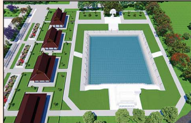
မုစလိန္နုအိုင်

၁။ နိုင်ငံတော်စီမံအုပ်ချုပ်ရေးကောင်စီဥက္ကဋ္ဌ၊ တပ်မတော်ကာကွယ်ရေးဦးစီးချုပ် ဗိုလ်ချုပ်မှူးကြီးမင်းအောင်လှိုင် ဦးဆောင်သည့် (၇)ရက်သား၊ သမီး၊ ဘုရားဒါယကာ၊ ဒါယိကာမတို့က မာရဝိဇယပုဒ္ဒရုပ်ပွားတော်မြတ်ကြီးအား မြန်မာနိုင်ငံတွင် ထေရဝါဒပုဒ္ဒသာသနာတော်ထွန်းလင်းတောက်ပလျက်ရှိသည်ကို ကမ္ဘာကိုပြသရန်၊ တိုင်းပြည်အေးချမ်းသာယာမှုရှိစေရန်၊ ရုပ်ပွားတော်မြတ်ကြီးအား ပြည်တွင်း၊ ပြည်ပဘုရားဖူးများလာရောက်ခြင်းဖြင့် ဒေသတိုးတက်စည်ကားမှုကို အထောက်အကူဖြစ်စေရန်၊ နိုင်ငံတော်ဖွံ့ဖြိုးတိုးတက်မှုအား အထောက်အကူဖြစ်စေရန် ရည်သန်လျက် ပြည်ထောင်စုနယ်မြေ နေပြည်တော်၊ ဒက္ခိဏသီရိမြို့နယ်အတွင်း၌ သာသနာတော်ထုံး၊ ရုပ်ပွားဆင်းတုတော်ထုံး၊ မြန်မာ့ရိုးရာတည်ထုံးများနှင့်အညီ တည်ဆောက်ပူဇော်လျက် ရှိပါသည်။