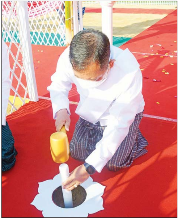
နိုင်ငံတော်စီမံအုပ်ချုပ်ရေးကောင်စီဝင် ဒုတိယဗိုလ်ချုပ်ကြီး စိုးထွဋ် ရတနာပန္နက်တော် စိုက်ထူပူဇော်စဉ်။