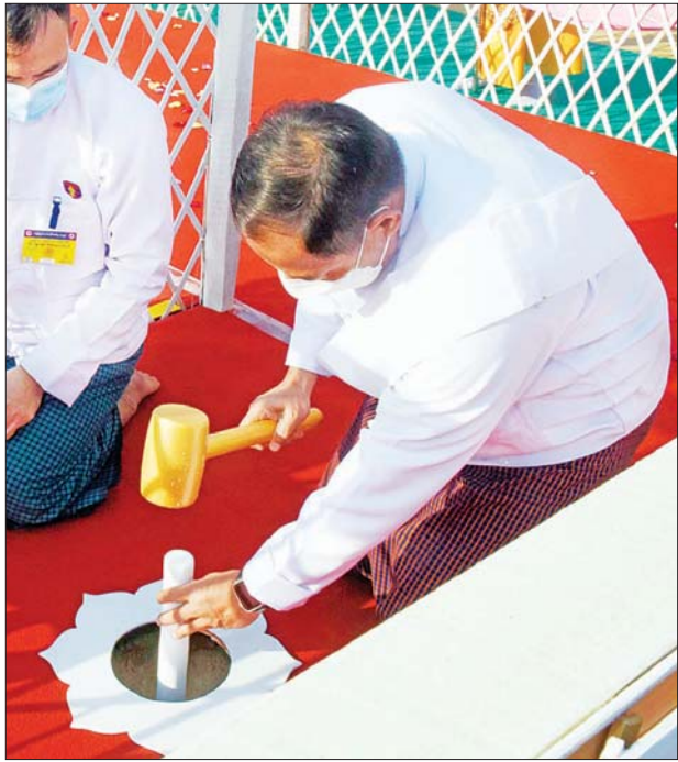
နိုင်ငံတော်စီမံအုပ်ချုပ်ရေးကောင်စီဝင် ဒုတိယဗိုလ်ချုပ်ကြီး ရာပြည့် ရတနာပန္နက်တော် စိုက်ထူပူဇော်စဉ်။