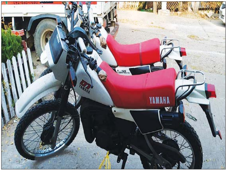
ကသာခရိုင် ထီးချိုင့်မြို့နယ် အတွင်း ဖမ်းဆီးရမိသည့် လိုင်စင်မဲ့ မော်တော် ဆိုင်ကယ် နှစ်စီး။

ကုန်သွယ်မှုတိုက်ဖျက်ရေးအဖွဲ့၏ စီမံခန့်ခွဲမှု ဖြင့် ကော့သောင်းမြို့နယ် စီမံအုပ်ချုပ်ရေးမှူး ဦးဆောင်သည့်အဖွဲ့နှင့် အကောက်ခွန်အဖွဲ့များမှ စစ်ဆေးမှုများဆောင်ရွက်ရာ ကော့သောင်းမြို့နယ် ပဲခူးတံဆိပ်တွင် တရားဝင်စာရွက်စာတမ်း အထောက် အထား တစ်စုံတစ်ရာ တင်ပြနိုင်ခြင်းမရှိသည့် ထိုင်းနိုင်ငံထုတ် စားသောက်ကုန်ပစ္စည်းများ (ခန့်မှန်း တန်ဖိုးငွေကျပ် ၁၄၆၀၀၀၀)ကို ဖမ်းဆီးရမိခဲ့ပြီး အကောက်ခွန်ဥပဒေနှင့်အညီ အရေးယူ ဆောင်ရွက် လျက်ရှိသည်။ ထို့အပြင် ယနေ့တွင် စစ်ကိုင်းတိုင်းဒေသကြီး တရားမဝင်ကုန်သွယ်မှုတိုက်ဖျက်ရေး အဖွဲ့အစည်း၏ စီမံခန့်ခွဲမှုဖြင့် မြန်မာနိုင်ငံရံတပ်ဖွဲ့ ဦးဆောင်သော