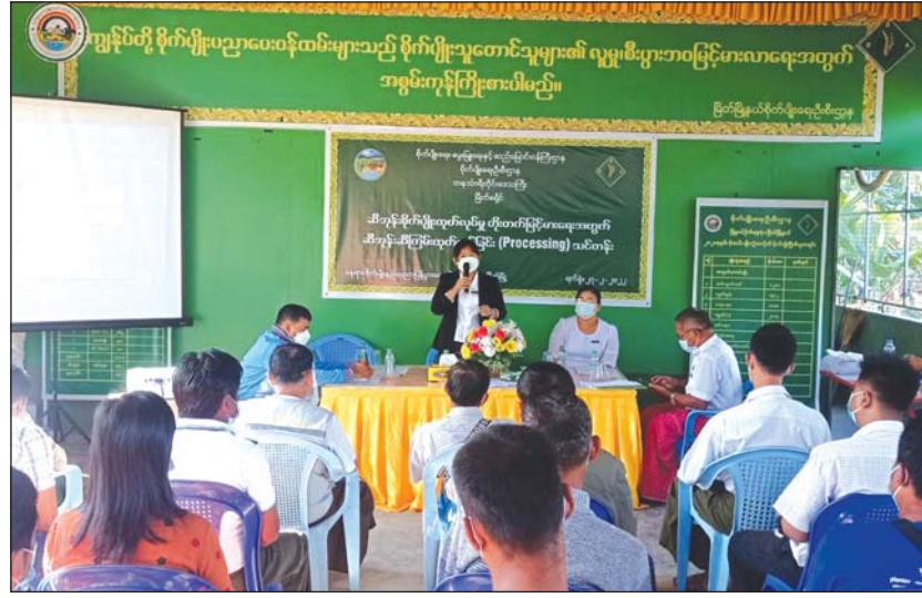
ခရိုင်စိုက်ပျိုးရေးဦးစီးဌာနမှူးက သင်တန်းအကြောင်း ရှင်းလင်းပြောကြားစဉ်။

သင်တန်းသား သင်တန်းသူ ၄၀ တက်ရောက် ကာ ခရိုင်စိုက်ပျိုးရေးဦးစီးဌာနမှူးက သင်တန်း ဖွင့်လှစ်ခြင်းနှင့်ပတ်သက်၍ ရှင်းလင်း ပြောကြားသည်။ သင်တန်းတွင် ခရိုင်စိုက်ပျိုးရေးဦးစီး ဌာနမှူးနှင့် ဝန်ထမ်းသုံးဦး၊ ရွှေဒူးခြံနှင့် ညောင်ပင်ကွင်းခြံတို့မှ တာဝန်ခံများက ဆီအုန်းစိုက်ပျိုးမှုအစဉ်၊ စိုက်ဧကနှင့် ဆီအုန်းခူးဆွတ်မှုအကြောင်း၊ ဆီအုန်းသီးခိုင် ချိန်တွယ်လက်ခံခြင်း၊ ဆီအုန်း ဆီကြမ်း ထုတ်လုပ်ခြင်း၊ စားအုန်းဆီသန့်ထုတ်လုပ်ခြင်း၊ ကြက်၊ ပွေး၊ ဖြူ၊ ရှဉ့်များ ကာကွယ်နိမ်နင်း နည်းများ စသည့် အကြောင်းအရာများကို အသိပညာပေး ဆွေးနွေးပို့ချခဲ့သည်။