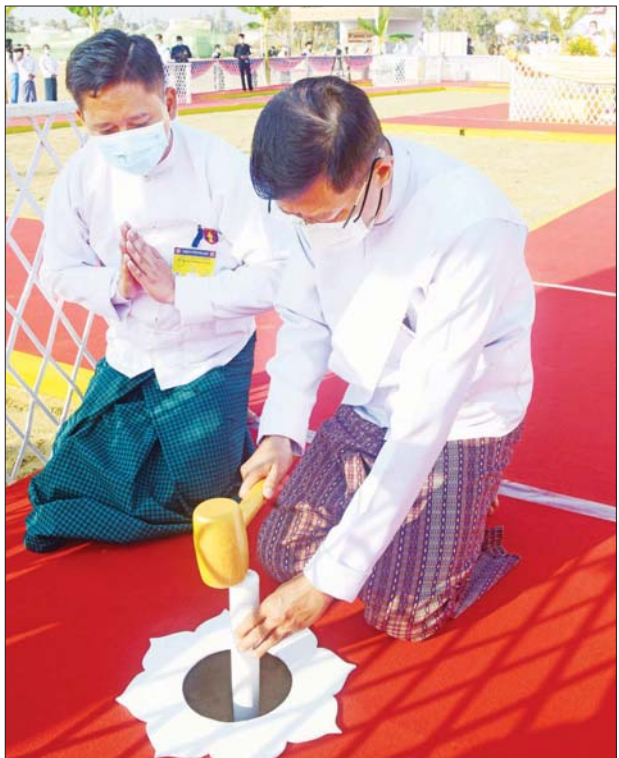
နိုင်ငံတော်စီမံအုပ်ချုပ်ရေးကောင်စီဝင် ဗိုလ်ချုပ်ကြီး မြထွန်းဦး ရတနာပန္နက်တော် စိုက်ထူပူဇော်စဉ်။