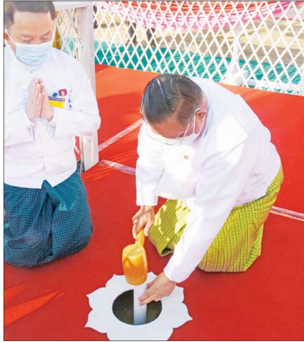
ပြည်ထောင်စုဝန်ကြီး ဦးဝဏ္ဏမောင်လွင် ရတနာပန္နက်တော် စိုက်ထူ ပူဇော်စဉ်။