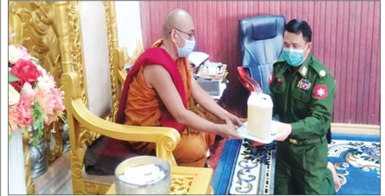
တပ်မတော်(ကြည်း၊ ရေ၊ လေ)မိသားစုများနှင့် စေတနာရှင် ပြည်သူများက ဆွမ်းဆန်တော်၊ ဆီ၊ ဆား၊ ပဲ အမယ် လေးမျိုး နေ့ဆွမ်းများနှင့် ငွေလှူဒါန်း

မြို့နယ်ရှိ လေသာကျောင်းတိုက်သို့လည်း ကောင်း၊ စစ်ကိုင်းတိုင်းဒေသကြီး မုံရွာ မြို့နယ်ရှိ အုတ်ကံတောကျောင်းတိုက် သို့လည်းကောင်း၊ တနင်္သာရီတိုင်းဒေသ ကြီး ထားဝယ်မြို့နယ်ရှိ မြို့မယဉ်ငေး သာသနာရိပ်သာကျောင်းတိုက်သို့ လည်း ကောင်း၊ မန္တလေးတိုင်းဒေသကြီး ကျောက်ပန်းတောင်းမြို့နယ်ရှိ ဥက္ကံဆည် ပေါ်ကျောင်းတိုက်သို့ လည်းကောင်း (ယာပုံ)၊ ဧရာဝတီတိုင်းဒေသကြီး ကန်ကြီးထောင့်မြို့နယ်ရှိ မဟာသီရိ မင်္ဂလာရာမပရိယတ္တိ စာသင်တိုက်သို့ လည်းကောင်း ဆရာတော်၊ သံဃာတော် များအတွက် ဆွမ်းဆန်တော်များကို တာဝန်ရှိသူများက သွားရောက်ဆက်ကပ် လှူဒါန်းကြကြောင်း သိရသည်။