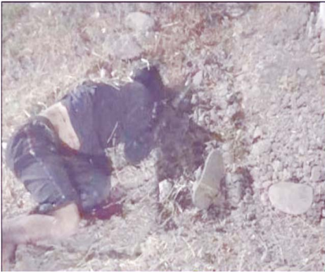
သေဆုံးသူ အမျိုးသား(စိစစ်ဆဲ)