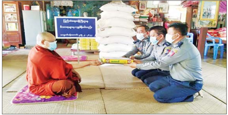
နေပြည်တော် ဖေဖော်ဝါရီ ၂၇ တပ်မတော်(ကြည်း၊ ရေ၊ လေ) အရာရှိ၊ စစ်သည်၊ အရာထမ်း၊ အမှုထမ်းများနှင့် စေတနာ ရှင်အလှူရှင်များက မြို့နယ်အသီးသီးရှိ ဘုန်းတော်ကြီးကျောင်းများ၊ သာသနာ့နယ်ဝင် သီလရှင်ကျောင်းများနှင့် ဘာသာရေးကျောင်းများသို့ ဆွမ်းဆန်တော်၊ ဆီ၊ ဆား၊ ပဲ အမယ် လေးမျိုးနှင့် လှူဖွယ်ပစ္စည်းများ လှူဒါန်းခြင်း၊ နေ့ဆွမ်းများဆက်ကပ်လှူဒါန်း ခြင်းနှင့် ကျန်းမာရေးစစ်ဆေးပေးခြင်းများကို ဆောင်ရွက်လျက်ရှိသည်။