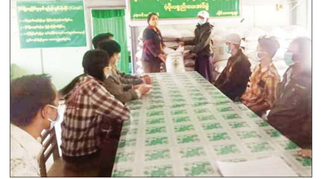
တွင် ကျောစီမြစ်ရေတင်၊ ကျောက် တလုံးဆည်၊ ဆင်တံဝဆည်၊ တောင်သာဆည်၊ ဝဲလောင်ဆည်၊ ဝဲလောင်ဆည်ရေသောက် ဒေသ များတွင် နွေစပါးဧက ၁၂၀၀ စိုက်ပျိုးနိုင်ရေး လျာထားကြောင်း သိရသည်။ ကျော်မျိုးနိုင်(တောင်သူ)

ချယ်စိုက်ပျိုးရန် ပေါင်စနစ်ဖြင့် ပျိုးထောင်ရန်၊ ပျိုးခင်းစနစ်တကျ ပြုစုရန်တို့ကို ရှင်းလင်းပြောကြား ခဲ့သည်။ ထို့နောက် တစ်ဧကလျှင် မနောသုခ (RS) မျိုးသန့်စပါး တစ်တင်းနှုန်းဖြင့် ဧက ၁၀၀ အတွက် မျိုးစပါး တင်း ၁၀၀ ကို တောင်သူ ၆၈ ဦးထံ အခမဲ့ဖြန့်ဝေ ခဲ့သည်။ တောင်သူမြို့နယ်တွင် ၂၀၂၁- ၂၀၂၂ ခုနှစ် နွေစပါးစိုက်ပျိုးရာသီ