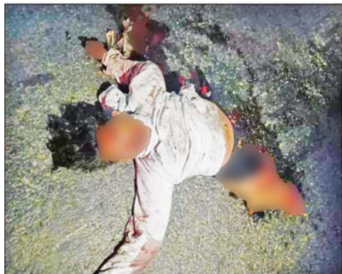
သေဆုံးသူ အမျိုးသား(စိစစ်ဆဲ)