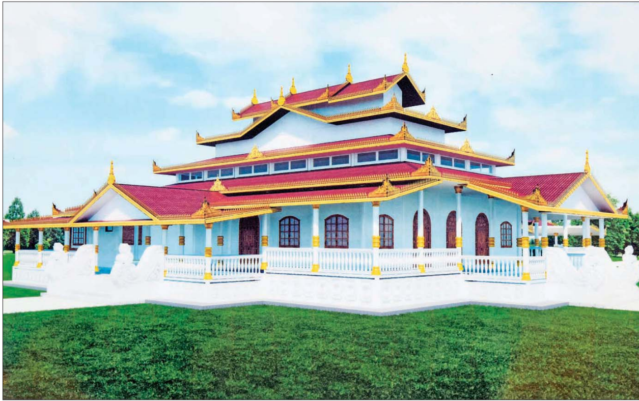
ဗုဒ္ဓဥယျာဉ်အတွင်း တည်ဆောက်မည့် ကျောင်းဆောင်။