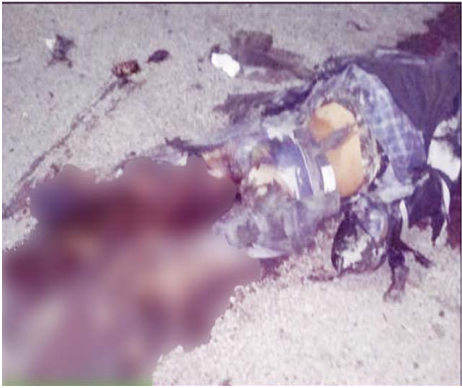
သေဆုံးသူ အမျိုးသား(စိစစ်ဆဲ)