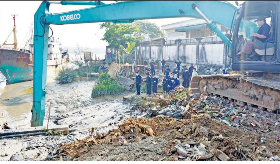
ယင်းနောက် ရွှေလင်ပန်းချောင်းစက်မှုဇုန် စီမံခန့်ခွဲရေး ရုံး ကနောင်ခန်းမ၌ စက်မှုဇုန်တာဝန်ရှိသူများက အမှတ် (၁) မြောင်းနှင့် အမှတ် (၂) မြောင်း ရေစီးရေလာအခြေအနေနှင့် ဦးအောင်သူလမ်းနှင့် ကျန်စစ်သားလမ်းအကြား မီးသတ်ရေကန် ပြန်လည်ဆယ်ယူရန် လိုအပ်ချက်များကို ရှင်းလင်းတင်ပြ