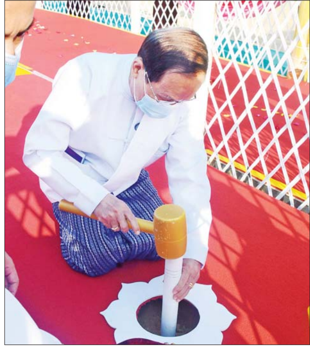
ပြည်ထောင်စုဝန်ကြီး ဦးကိုကို ရတနာပန္နက်တော် စိုက်ထူပူဇော် စဉ်။

မင်္ဂလာအခမ်းအနား ကျင်းပ ပြည်ထောင်စုနယ်မြေ နေပြည် တော် ဒက္ခိဏသီရိမြို့နယ်ရှိ မာရဝိဇယဗုဒ္ဓရုပ်ပွားတော်တွင် တည်ဆောက်မည့် ကျောင်း ဆောင်တော် ရတနာပန္နက် တော်တင် မင်္ဂလာအခမ်းအနား ကျင်းပစဉ်။