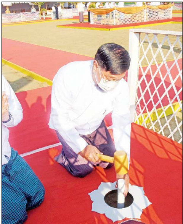
နိုင်ငံတော်စီမံအုပ်ချုပ်ရေးကောင်စီဝင် ဗိုလ်ချုပ်ကြီး တင်အောင်စန်း ရတနာပန္နက်တော် စိုက်ထူပူဇော်စဉ်။