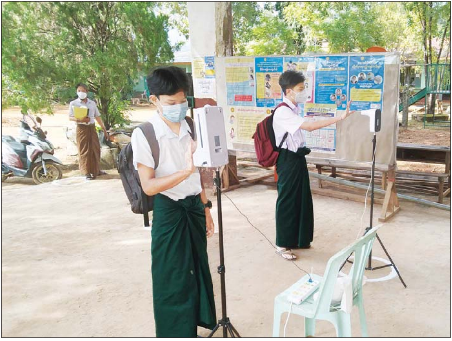
၂၀၂၁ ခုနှစ် နိုဝင်ဘာလက အခြေခံပညာကျောင်းများ ပြန်လည်ဖွင့်လှစ်ရာ အ.ထ.က ကော့သောင်း၌ ကျောင်းသားများ ကိုဗစ်-၁၉ ရောဂါ ကူးစက်မှု ရှိ မရှိ ကိုယ်အပူချိန်တိုင်းတာစစ်ဆေးစဉ်။

၂၀၁၉ ခုနှစ် နှောင်းပိုင်းမှ စတင်ဖြစ်ပွားခဲ့သော ကိုဗစ်-၁၉ သည် နှစ်နှစ်ကျော်လာသည့် ယနေ့ထက် တိုင် ကူးစက်မှုများဆက်လက်ရှိနေဆဲဖြစ်သည်။ ကိုဗစ်-၁၉ မှာ ဗီဇမျိုးကွဲများဖြင့် ဆက်လက်ရရှိသန်နေဆဲဖြစ်ရာ ကူးစက်မှုထိန်းချုပ်ရေး၊ ကာကွယ်ရေးနှင့် ကုသရေးများ ဆောင်ရွက်နေရသဖြင့် အချိန်ကြာလာသည်နှင့်အမျှ ယင်းကြောင့် ဖြစ်ပွားလာသည့် အကျိုးဆက်များသည် ကဏ္ဍအသီးသီးသို့ သက်ရောက်လျက်ရှိပါသည်။ ကိုဗစ်-၁၉ ကြောင့် ထိခိုက်ကျဆင်းနေသည့် စီးပွားရေးများပြန်လည်ထူထောင်ရေး၊ ဝင်ငွေလျော့ကျလာမှု၊ ပညာသင်ကြားရာတွင် ကွဲပြားခြားနားလာမှု၊ ကာကွယ်ဆေးရရှိနိုင်မှုတို့တွင် မညီမျှမှုများကြောင့် ဆင်းရဲနွမ်းပါးသူများနှင့် ထိခိုက်လွယ်သူများအပေါ် အချိုးမညီမျှမှုများ ဖြစ်ပေါ်လာကြောင်း ကမ္ဘာ့ဘဏ်၏ ၂၀၂၁ ခုနှစ် ကိုဗစ်-၁၉ သုံးသပ်ချက် အစီရင်ခံစာတွင် ဖော်ပြထားပါသည်။