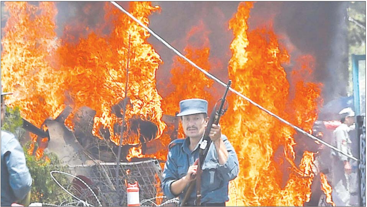
အာဖဂန်နစ္စတန်နိုင်ငံ ကဘူးလ်လေဆိပ်၌ ၂၀၂၁ ခုနှစ် ဩဂုတ် ၂၆ ရက်က အသေခံရခဲ့တဲ့တိုက်ခိုက်မှုကြောင့် မီးလောင်ပေါက်ကွဲမှုများ ဖြစ်ပွားစဉ်။

အရေးကြီးတဲ့ဆုံးဖြတ်ချက်တွေကို မှန်မှန်ကန်ကန်ချမှတ်နိုင်ဖို့ တစ်ခါတစ်ရံအခက်အခဲဖြစ်ရခြင်းဟာ အတိတ်ကသမိုင်းသင်ခန်းစာကို မယူတတ်တဲ့အတွက်ကြောင့် ဖြစ်ပါတယ်။ ကိုယ်တိုင်ပြုလုပ်လိုက်တဲ့ အမှားတစ်ခုကနေ သင်ခန်းစာယူတတ်ဖို့လိုသလို သူတစ်ပါးအမှား ကနေလည်း သင်ခန်းစာဖော်ထုတ်တတ်ခြင်းဟာ မိမိအတွက် အခွင့် အရေးကောင်းတစ်ခု ဖြစ်နိုင်ပါတယ်။ အတိတ်ကသမိုင်းကို သင်ခန်း စာအဖြစ် မယူတတ်ရင် မကောင်းတဲ့သမိုင်းဟာ သံသရာလည်တတ် ပါတယ်။