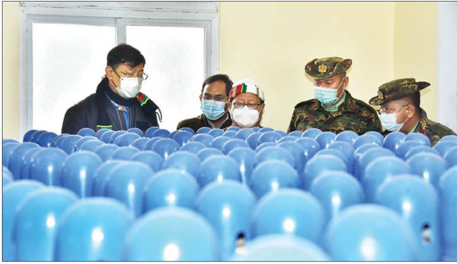
နိုင်ငံတော်စီမံအုပ်ချုပ်ရေးကောင်စီအဖွဲ့ဝင် ပြည်ထောင်စုဝန်ကြီး ဗိုလ်ချုပ်ကြီး မြထွန်းဦး၊ ဦးမောင်းဟာ တို့ အောက်ဆီဂျင်သိုလှောင်ထားမှုအခြေအနေကို ကြည့်ရှုစဉ်။

တည်ဆောက်ဆဲ အောက်ဆီဂျင်စက်ရုံနှင့် လီတာ ၄၀ ဆွဲ အောက်ဆီဂျင်အိုးများဖြင့် အောက်ဆီဂျင် သိုလှောင်ထားရှိမှုအခြေအနေကို သွားရောက်ကြည့်ရှု ကြသည်။ ယင်းနောက် နိုင်ငံတော် စီမံအုပ်ချုပ်ရေး ကောင်စီအဖွဲ့ဝင် ကာကွယ်ရေးဝန်ကြီးဌာန ပြည်ထောင်စုဝန်ကြီး ဗိုလ်ချုပ်ကြီး မြထွန်းဦး၊ ဦးမောင်းဟာနှင့် အဖွဲ့ဝင်များသည် ဟားခါးမြို့ ပြည်နယ်ရဲတပ်ဖွဲ့မှူးရုံးသို့ ရောက်ရှိပြီး ပြည်နယ် ရဲတပ်ဖွဲ့ဝင်များနှင့် တွေ့ဆုံကာ နယ်မြေဒေသ တည်ငြိမ်အေးချမ်းရေးဆိုင်ရာ ကိစ္စများနှင့်ပတ်သက် ၍ လိုအပ်သည်များ ဆွေးနွေးမှာကြားပြီး စားသောက် ဖွယ်ရာများ ထောက်ပံ့ပေးအပ်သည်။ ထိုမှတစ်ဆင့်