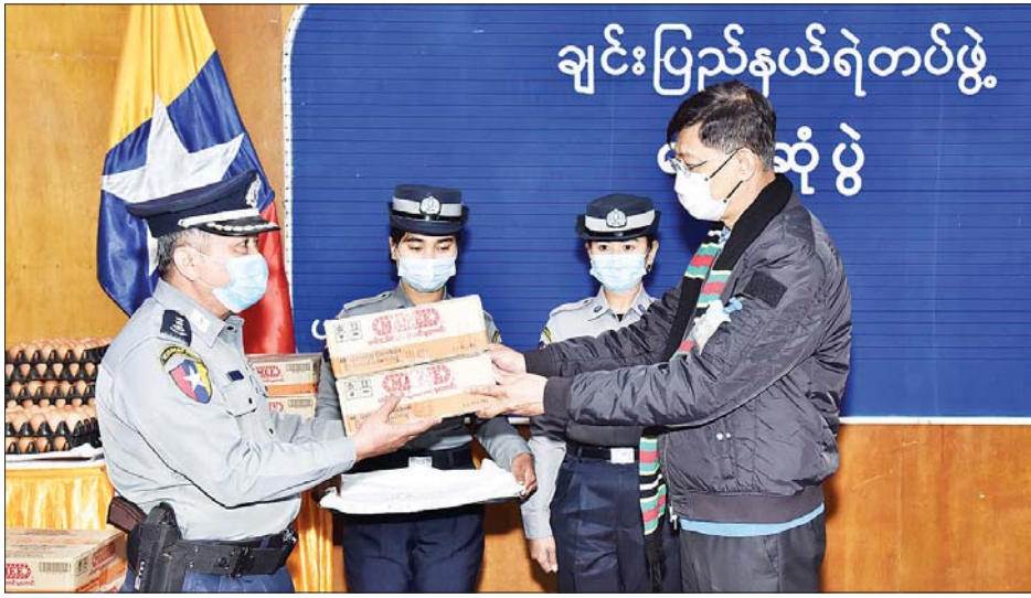
နိုင်ငံတော်စီမံအုပ်ချုပ်ရေးကောင်စီအဖွဲ့ဝင် ပြည်ထောင်စုဝန်ကြီး ဗိုလ်ချုပ်ကြီး မြထွန်းဦး ရဲတပ်ဖွဲ့ဝင် များအား စားသောက်ဖွယ်ရာများ ထောက်ပံ့ပေးအပ်စဉ်။