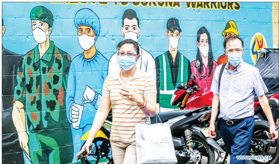
ဖိလစ်ပိုင်နိုင်ငံ၌ ကိုရိုနာဗိုင်းရပ်စ်သူရဲကောင်းများကို ဂုဏ်ပြုရေးဆွဲထားသော နံရံဆေးရေးပန်းချီ တစ်ခုကို တွေ့ရစဉ်။

၅၈၆၅၇ ဦး ကျဆင်းခဲ့သည်။ လွန်ခဲ့သောနှစ် ကိုဗစ်-၁၉ စတင်ဖြစ်ပွားချိန်မှ စကာ ဖိလစ်ပိုင်နိုင်ငံသည် ကိုဗစ်-၁၉ ကူးစက်ဖြစ်ပွား မှု လှိုင်းဂယက်လေးခုရှိက်ခတ်ခြင်းကို ခံခဲ့ရသည်။ နောက်ဆုံး ကိုဗစ်-၁၉ လှိုင်းသည် စက်တင်ဘာ လတွင် မြင့်တက်ခဲ့ပြီး ဇန်နဝါရီ ၁၅ ရက် တစ်နေ့ တည်း ကိုဗစ်-၁၉ ကူးစက်ဖြစ်ပွားသူပေါင်း ၃၉၀၀၄ ဦးဖြင့် ကူးစက်ဖြစ်ပွားနှုန်း အမြင့်ဆုံးဖြစ်ခဲ့သည်။ ကိုဗစ်-၁၉ ကူးစက်ဖြစ်ပွားသူ သုံးရက်ဆက်တိုက် ၂၀၀၀ အောက် ကျဆင်းခဲ့ခြင်းဖြစ်သည်။ အိုမီခရွန် ဗိုင်းရပ်စ်ကူးစက်မှု ကျဆင်းလာသောကြောင့် ကိုဗစ်-၁၉ ကူးစက် ဖြစ်ပွားမှုများလည်း ကျဆင်းလာ ခဲ့သည်။ အရှေ့တောင်အာရှ နိုင်ငံတစ်နိုင်ငံဖြစ်သော ဖိလစ်ပိုင်နိုင်ငံတွင် လူဦးရေသန်း ၁၀၀ ရှိသည့်အနက် ကိုဗစ်-၁၉ စမ်းသပ်စစ်ဆေးပြီးသူပေါင်း ၂၆ သန်း ကျော်လွန်လာပြီဖြစ်သည်။ ဆင်ဟွာ