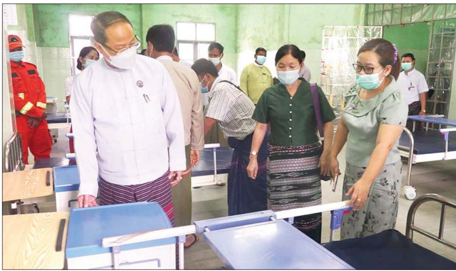
International Holding Group Co.,Ltd မှ ကိစ္စရပ်များကို ဆွေးနွေးခဲ့ကာ ပြည်နယ် တည်ဆောက်ရေးကာလကို ပထမအကြိမ်တိုးမြှင့် ရင်းနှီးမြှုပ်နှံမှုကော်မတီ၏ ဒေသတွင်းကွင်းဆင်း ခွင့်ပြုရန်နှင့် ပြည်ပဝန်ထမ်း ၃၀ တိုးမြှင့်ခန့်ထား စစ်ဆေးဆောင်ရွက်ခဲ့မှု အခြေအနေများကို ခွင့်ပြုရန် တင်ပြလာခြင်းအပေါ် ပြည်နယ် ရှင်းလင်းတင်ပြပြီး ပြည်နယ်ဝန်ကြီးချုပ်က နိဂုံးချုပ် အစိုးရအဖွဲ့သို့ သဘောထားတောင်းခံလာခြင်း၊ အမှာစကားပြောကြားကြောင်း သိရသည်။ စောမျိုးမင်းသိန်း (ပြန်/ဆက်)

ယင်းနောက် ကရင်ပြည်နယ်ရင်းနှီးမြှုပ်နှံမှု ကော်မတီ၏ (၂/၂၀၂၂) အစည်းအဝေးကို မွန်းလွဲ ၂ နာရီက ပြည်နယ်အစိုးရအဖွဲ့ရုံး အစည်းအဝေး ခန်းမ(၃)၌ ကျင်းပရာ ပြည်နယ်ရင်းနှီးမြှုပ်နှံမှု ကော်မတီဥက္ကဋ္ဌ ပြည်နယ်ဝန်ကြီးချုပ်ဦးစောမြင့်ဦး က အမှာစကားပြောကြားပြီး Myanmar Yatai