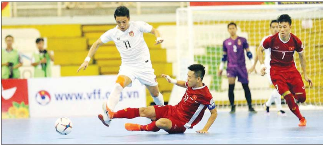
၂၀၁၉ အာဆီယံ ဖူဆယ်ပြိုင်ပွဲတွင် မြန်မာနှင့် ဗီယက်နမ် တွေ့ဆုံခဲ့စဉ်။