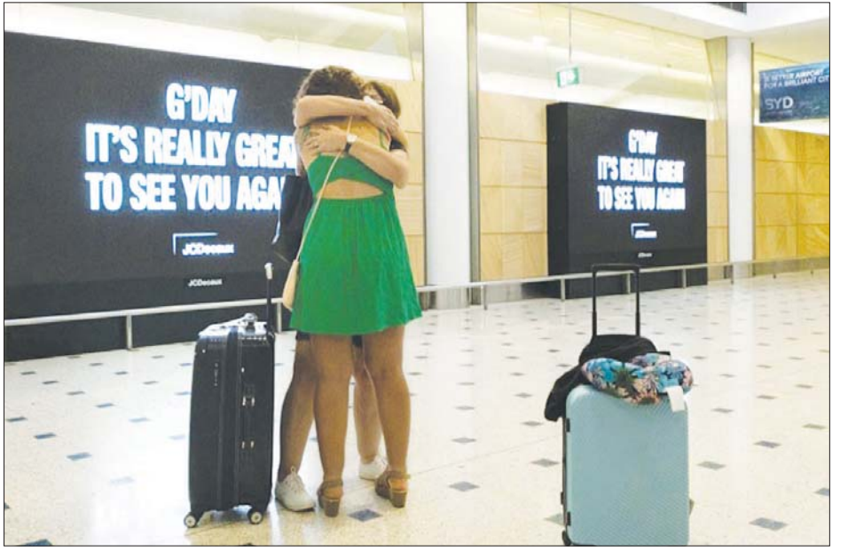
ဆစ်ဒနီအပြည်ပြည်ဆိုင်ရာလေဆိပ်တွင်ပွေ့ဖက်နေကြသည့် ခရီးသည်များကို တွေ့ရစဉ်။

ဆစ်ဒနီ ဖေဖော်ဝါရီ ၂၁ ဩစတြေးလျနိုင်ငံက နိုင်ငံခြားသားခရီးသွားများကို နိုင်ငံအတွင်းဝင်ရောက်ခွင့်ပိတ်ထားသည်မှာ နှစ်နှစ်နီးပါး ကြာမြင့်လာပြီဖြစ်သော်လည်း ကာကွယ်ဆေးအပြည့်ထိုးပြီးသောခရီးသွားဧည့်သည်များအတွက် ယခုအခါ ပြည်ဝင်ခွင့်ပိတ်စာကို ပြန်လည်ခွင့်ပြုပေးတော့မည်ဟု သိရသည်။ ကာကွယ်ဆေးအပြည့်ထိုးထားကြောင်း စိစစ်ဆောင်ထားသည့် ခရီးသည်များကို ဖေဖော်ဝါရီ ၂၁ ရက်မှစတင်ကာ လက်ခံနေပြီဖြစ်သည်။ အမေရိကန်ပြည်ထောင်စုနှင့်ကနေဒါနိုင်ငံတို့မှ လေကြောင်း လိုင်းများသည် ဆစ်ဒနီမြို့လေဆိပ်သို့ တစ်စင်းပြီးတစ်စင်း ဆိုက်ရောက်လာကြသည်။ အချို့သော ခရီးသွား များမှာ မိသားစုနှင့် ပြန်လည်ဆုံစည်းခွင့်ရရှိသည့်အတွက် ပျော်ရွှင်နေကြသည်ကိုတွေ့ရသည်။ ကနေဒါနိုင်ငံ မှ အမျိုးသားတစ်ဦးကမူ ဩစတြေးလျနိုင်ငံရှိ ၎င်း၏မိဘများနှင့် ကပ်ရောဂါစတင်သည့်အချိန်မှစကာ တွေ့ခွင့်မရတော့ဘဲ ယခုပထမဆုံးအကြိမ်အဖြစ် ပြန်လည်ဆုံစည်းခွင့်ရရှိသည်ဟု ပြောသည်။ ၂၀၂၀ ပြည့်နှစ် မတ်လအတွင်းမှစတင်ကာ ကိုဗစ်-၁၉ကူးစက်ပျံ့နှံ့မှုကိုကာကွယ်ရန်အလို့ငှာ နိုင်ငံခြားခရီးသွားများကို ပြည်ဝင်ခွင့်ပိတ်ထားခဲ့သည်။