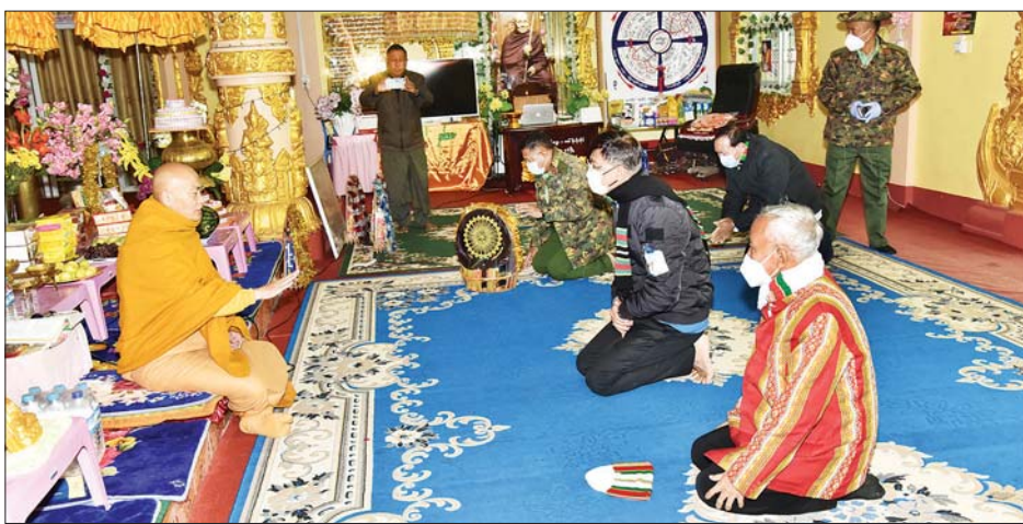
နိုင်ငံတော်စီမံအုပ်ချုပ်ရေးကောင်စီအဖွဲ့ဝင် ပြည်ထောင်စုဝန်ကြီး ဗိုလ်ချုပ်ကြီး မြထွန်းဦး၊ ဦးမောင်းဟာတို့ ဟားခါးမြို့ တောင်တန်းသာသနာပြု ဆရာတော် ဘဒ္ဒန္တ ဒေါက်တာအရှင်တေဇောသာရအား ဖူးမြော် ကြည်ညိုစဉ်။

ကောင်စီအဖွဲ့ဝင် ကာကွယ်ရေးဝန်ကြီးဌာန ပြည်ထောင်စုဝန်ကြီး ဗိုလ်ချုပ်ကြီး မြထွန်းဦးနှင့် အဖွဲ့ဝင်များက ဆေးရုံဝန်ထမ်းနှင့် လူနာများအတွက် ထောက်ပံ့ပစ္စည်းများကို ပေးအပ်ကြရာ ဆေးရုံအုပ် ကြီးနှင့် တာဝန်ရှိသူများက လက်ခံရယူကြသည်။ ထို့နောက် နိုင်ငံတော်စီမံအုပ်ချုပ်ရေးကောင်စီ အဖွဲ့ဝင် ကာကွယ်ရေးဝန်ကြီးဌာန ပြည်ထောင်စု ဝန်ကြီး ဗိုလ်ချုပ်ကြီး မြထွန်းဦး၊ ဦးမောင်းဟာ၊ ပြည်နယ်ဝန်ကြီးချုပ်နှင့် တာဝန်ရှိသူများသည်