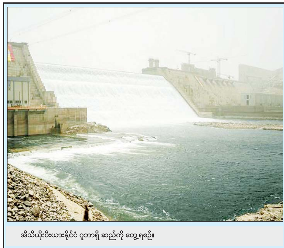
အိသီယိုးပီးယားနိုင်ငံ ဂူဘာရီ ဆည်ကို တွေ့ရစဉ်။