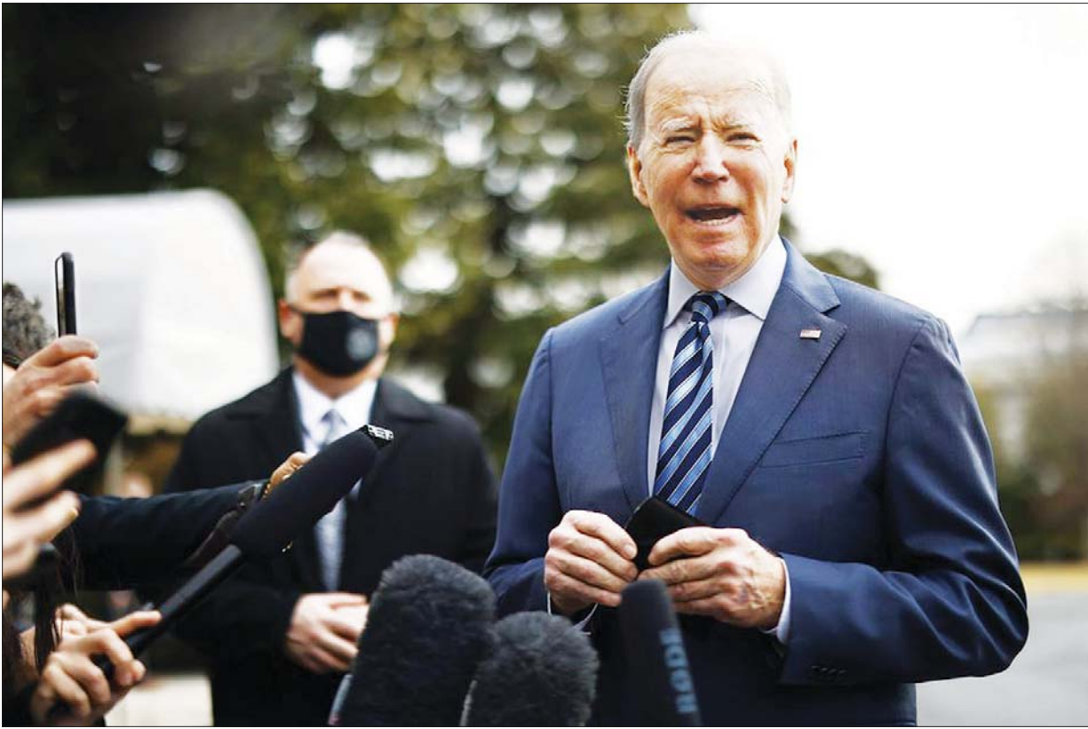
အမေရိကန်သမ္မတ ဂျိုးဘိုင်ဒန်

စီးပွားပျက်ကပ်ဟာ အိမ်ဖြူတော်ကို ထိန်းချုပ်ထားတဲ့ သို့မဟုတ်