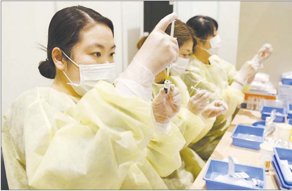
ဂျပန်နိုင်ငံ၌ ကိုဗစ်-၁၉ ကာကွယ်ဆေးထိုးပေးရန် ပြင်ဆင်နေမှုများကို တွေ့ရစဉ်။

တိုကျို ဖေဖော်ဝါရီ ၂၁ ဂျပန်နိုင်ငံ၌ ဆေးဘက်ဆိုင်ရာ အဖွဲ့အစည်းများနှင့် မြို့နယ်များ တွင် အသက် ငါးနှစ်မှ ၁၁နှစ်ကြား ကလေးများကို ကိုဗစ် - ၁၉ ကာကွယ်ဆေးထိုးပေးတော့မည် ဟုသိရသည်။ အဆိုပါ အသက် အရွယ်အုပ်စုကိုကာကွယ်ဆေးထိုး ပေးသည့်အစီအစဉ်အား ဖေဖော် ဝါရီ ၂၁ ရက်မှစတင်ကာ ပြည်သူ လူထုကို ကာကွယ်ဆေးထိုးပေး သည့်အစီအစဉ်တွင် ထည့်သွင်း ခဲ့သည်။ မေလအတွင်း တစ်နိုင်ငံ လုံးအနှံ့ကိုဗစ်-၁၉ ကာကွယ်ဆေး ၁၂ သန်းကို ဖြန့်ဝေသွားရန် အစိုးရက စီစဉ်ထားသည်။ ယခုလအစောပိုင်းမှ စတင်ကာ အချို့သော နေရာများတွင် ကာကွယ်ဆေးထိုးပေးသည့် အစီ အစဉ်ကိုစတင်ရန် မျှော်မှန်းထား သည်။ အသက် ငါးနှစ်မှ ၁၁နှစ် ကြားကလေးများကို ကာကွယ် ဆေးထိုးပေးရာတွင် အသက်