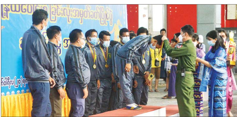
ရန်ကုန်တိုင်းဒေသကြီး ဝန်ကြီးချုပ်ဖလား မြို့နယ်ပေါင်းစုံ မြန်မာ့ရိုးရာခြင်းလုံးပိုင်းဖွဲ့အမှတ်ခတ် ဗိုလ်လုပွဲ ကို ဖေဖော်ဝါရီ ၂၀ ရက်က ရန်ကုန်မြို့ သုဝဏ္ဏပိုက်ကျော်ခြင်းအားကစားရုံ၌ ကျင်းပရာ တိုင်းဒေသကြီး ဝန်ကြီးချုပ်ကိုယ်စား လုံခြုံရေးနှင့် နယ်စပ်ရေးရာဝန်ကြီး ဗိုလ်မှူးကြီးဝင်းတင့်က ပထမဆုရ သာကေတ မြို့နယ်အသင်းအား တစ်ဦးချင်း ဆုတံဆိပ်၊ ငွေသားဆုနှင့် ဆုဖလားပေးအပ်ချီးမြှင့်စဉ်။

လက်စတာအသင်းသည် ပုဂံ အသင်းကို ဖိအားပေးကစားနိုင်ခဲ့ သော်လည်း ရရှိလာသည့် အပိုင် အခွင့်အရေးများကို အသုံးမချနိုင် ခဲ့သည့်အတွက် ရှုံးပွဲနှင့်ကြုံတွေ့ ချေပဂိုးကို ပွဲချိန် ၄၁ မိနစ်တွင် အောင်ဇော်