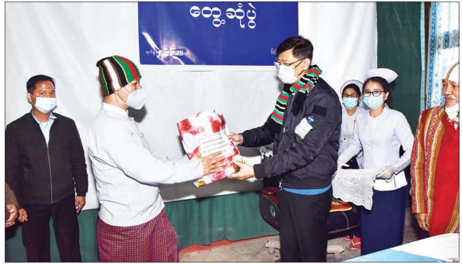
နိုင်ငံတော်စီမံအုပ်ချုပ်ရေးကောင်စီအဖွဲ့ဝင် ပြည်ထောင်စုဝန်ကြီး ဗိုလ်ချုပ်ကြီး မြထွန်းဦး ဆေးရုံ ဝန်ထမ်းနှင့် လူနာများအတွက် စားသောက်ဖွယ်ရာများ ထောက်ပံ့ပေးအပ်စဉ်။