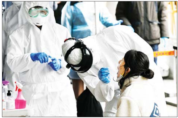
တောင်ကိုရီးယားနိုင်ငံ၌ ကျန်းမာရေးဝန်ထမ်းတစ်ဦးက ကိုဗစ်-၁၉ စမ်းသပ်စစ်ဆေးပေးနေစဉ်။

များအရ ၂၄ နာရီအတွင်း ကိုဗစ်- ၁၉ ကူးစက်ဖြစ်ပွားသူ ၉၅၃၆၂ ဦး ရှိလာမှုနှင့်အတူ နိုင်ငံတစ်ဝန်း ကိုဗစ်-၁၉ ကူးစက်ဖြစ်ပွားသူ ပေါင်း ၂၀၅၈၁၄၄ ဦးရှိလာခဲ့သည်။ ကိုဗစ်-၁၉ စမ်းသပ်စစ်ဆေး မှုများ လျော့နည်းလာသော ကြောင့် နေ့စဉ် ကိုဗစ်-၁၉ ကူးစက် ဖြစ်ပွားမှု ၁၀၀၀၀ အောက် လျော့နည်းကျဆင်းခဲ့သည်။ လွန်ခဲ့ သော သုံးရက်ဆက်တိုက်အတွင်း တောင်ကိုရီးယားနိုင်ငံတွင် နေ့စဉ် ကိုဗစ်-၁၉ ကူးစက်ဖြစ်ပွားသူ ၁၀၀၀၀ ကျော်လွန်ခဲ့သည်။ ဆင်ဟွာ