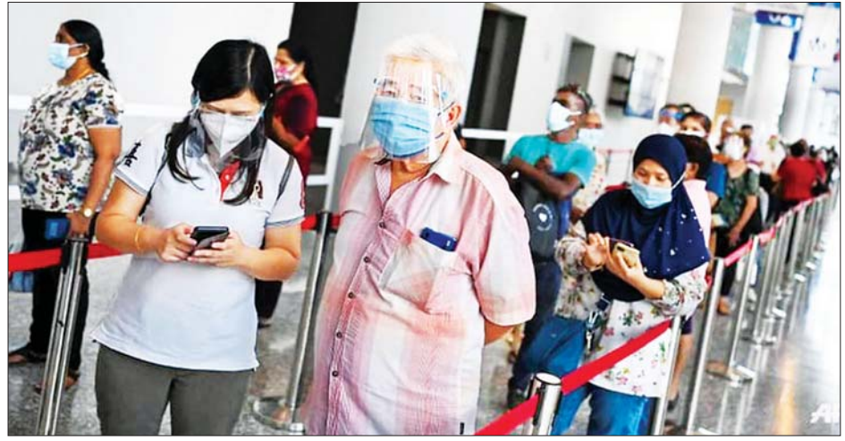
မလေးရှားနိုင်ငံ၌ ကိုဗစ်-၁၉ ကာကွယ်ဆေးထိုးရန် စောင့်ဆိုင်းနေသည်ကို တွေ့ရစဉ်။

မှာ ကာကွယ်ဆေး အနည်းဆုံး တစ်ကြိမ် ထိုးနှံပြီးဖြစ်ကြောင်း သိရပြီး ၇၈ ဒသမ ၈ ရာခိုင်နှုန်းမှာ ကာကွယ်ဆေးအပြည့်အဝ ထိုးနှံ ပြီးဖြစ်သည်။ ထို့အပြင် ၄၂ ဒသမ ၈ ရာခိုင်နှုန်းမှာ အပိုဆောင်း ကိုဗစ်-၁၉ ကာကွယ်ဆေး ထိုးနှံပြီး ဖြစ်ကြောင်း သိရသည်။ ဆင်ဟွာ