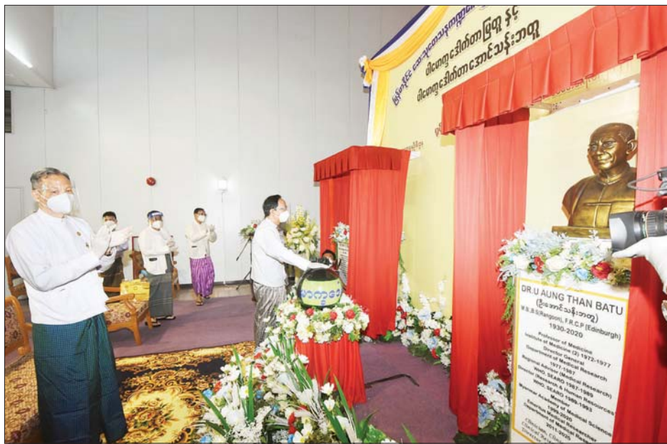
ပြည်ထောင်စုဝန်ကြီး ဒေါက်တာသက်ခိုင်ဝင်း မြန်မာနိုင်ငံ ကျန်းမာရေးဆိုင်ရာ သုတေသနညီလာခံ ရွှေရတုအထိမ်းအမှတ်အဖြစ် ဆေးသုတေသနဦးစီးဌာန၏ လက်ဦးတည်ထောင်သူ ပါမောက္ခဒေါက်တာ မြတူနှင့် ပါမောက္ခဒေါက်တာအောင်သန်းဘတူတို့၏ ရုပ်တုကို ဖွင့်လှစ်ပေးစဉ်။

ကမ္ဘာ့ကပ်ရောဂါ ကိုဗစ်-၁၉ ရောဂါတတိယလှိုင်းအား တိုက်ဖျက်ရာတွင် နိုင်ငံတော်စီမံအုပ်ချုပ်ရေးကောင်စီ၏ ဦးဆောင်လမ်းညွှန်မှုဖြင့် ကျန်းမာရေးဝန်ကြီးဌာန၏ အလေးထားဆောင်ရွက်ခဲ့မှု၊ ပုဂ္ဂလိကကဏ္ဍများ၏ ပံ့ပိုးကူညီဆောင်ရွက်ခဲ့မှု၊ ပြည်သူလူထု၏ ကျန်းမာရေးအသိပညာ ပိုမိုနားလည်သဘောပေါက်မှုများဖြင့် ပူးပေါင်းပါဝင် ဆောင်ရွက်ခဲ့ကြမှုများကြောင့် ကျော်လွှားခဲ့နိုင်ခြင်းကို မီးမောင်းထိုးပြသနိုင်ရန်ရည်ရွယ်ကာ ယခုနှစ်သုတေသနညီလာခံ၏ အဓိကသုတေသန ဦးတည်ချက်ခေါင်းစဉ် (Theme) အဖြစ် “မျှဝေစား၊ အသိတိုးပွား၊ ကိုဗစ်တတိယလှိုင်းအတွေ့အကြုံများ (Response to COVID-19 in Myanmar: Reflection after the Third Wave)” ဟု သတ်မှတ်ထားခြင်းဖြစ်ပါကြောင်း၊ နီးနှောဖလှယ်ပွဲတို့ကို သုတေသီများ၊ ကျွမ်းကျင်