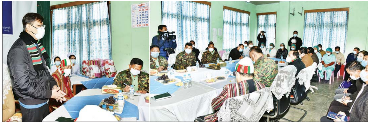
ဟားခါးမြို့ တောင်တန်းသာသနာပြုဆရာတော် ဘဒ္ဒန္တ ဒေါက်တာ အရှင်တေဇောသာရအား သွားရောက်ဖူးမြော်ကြည်ညိုပြီး လှူဖွယ်ပစ္စည်းများ၊ ဝတ္ထုငွေများ ဆက်ကပ်လှူဒါန်းကြသည်။ ထို့နောက် နိုင်ငံတော်စီမံအုပ်ချုပ်ရေးကောင်စီ အဖွဲ့ဝင် ကာကွယ်ရေးဝန်ကြီးဌာန ပြည်ထောင်စု ဝန်ကြီး ဗိုလ်ချုပ်ကြီး မြထွန်းဦးနှင့် အဖွဲ့ဝင်များသည် ဟားခါးမြို့ရှိ နယ်မြေခံတပ်သို့ သွားရောက်ပြီး အရာရှိ၊ စစ်သည်၊ ရဲမေများနှင့် တွေ့ဆုံကာ လိုအပ် သည်များ မှာကြား၍ စားသောက်ဖွယ်ရာများ ထောက်ပံ့ပေးအပ်ခဲ့ကြောင်း သတင်းရရှိသည်။

နိုင်ငံတော်စီမံအုပ်ချုပ်ရေးကောင်စီအဖွဲ့ဝင် ပြည်ထောင်စုဝန်ကြီး ဗိုလ်ချုပ်ကြီး မြထွန်းဦး ဟားခါးမြို့ ပြည်သူ့ဆေးရုံ၌ ကျန်းမာရေးဝန်ထမ်းများအား တွေ့ဆုံအမှာစကား ပြောကြားစဉ်။