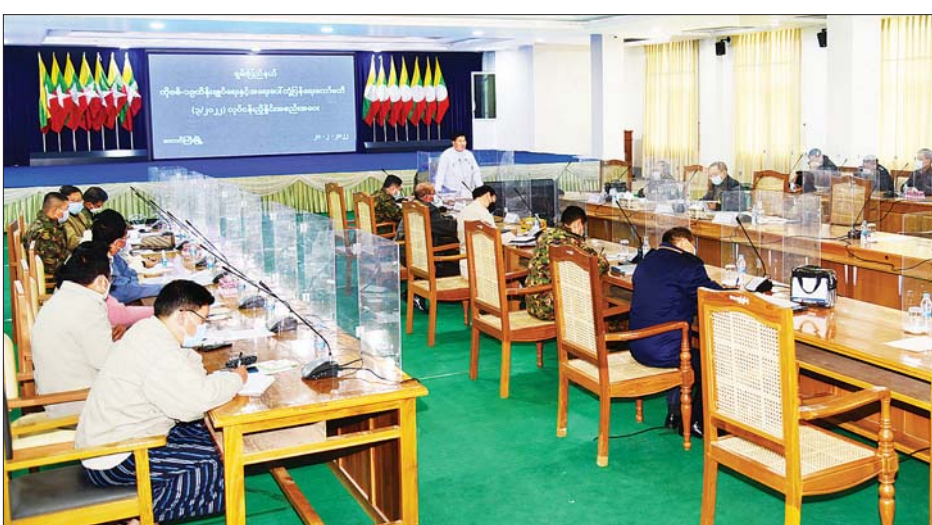
ဖြစ်ပွားမှုနှင့် ပြန်ပွားမှု များအား ပါက အလျင်အမြန်တုံ့ပြန်ရန်၊ ပြည်နယ် ကိုဗစ်-၁၉ အရေးပေါ် တုံ့ပြန်ရေးကော်မတီက ကြီးကြပ်၍ ထိန်းချုပ်ရန်၊ တွေ့ရှိမှုများ ရှိလာ ကွင်းဆက်ဖြတ်နိုင်ရန်ကိစ္စများကို

တောင်ကြီး ဖေဖော်ဝါရီ ၂၁ ရမ်းပြည်နယ် ကိုဗစ်-၁၉ ထိန်းချုပ် ရေးနှင့် အရေးပေါ်တုံ့ပြန်ရေး ကော်မတီ (၃/၂၀၂၂) လုပ်ငန်း ညှိနှိုင်း အစည်းအဝေးကို ဖေဖော်ဝါရီ ၂၁ ရက် နံနက် ၁၀ နာရီက တောင်ကြီးမြို့ ပြည်နယ်အစိုးရရုံး အစည်းအဝေး ခန်းမ၌ ကျင်းပသည်။