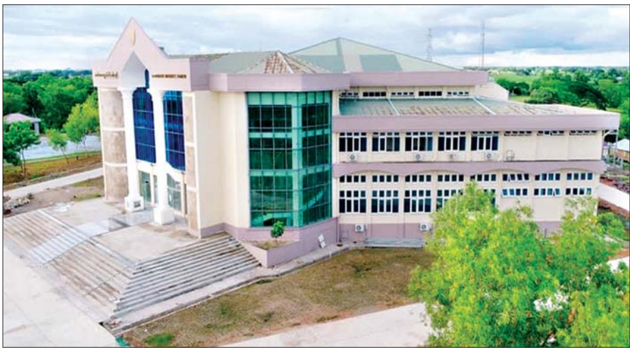
သမဝါယမနှင့် စီမံခန့်ခွဲမှုပညာတက္ကသိုလ်(သန်လျင်)။

တက္ကသိုလ်များ၏ မျှော်မှန်းချက်နှင့် သင်ကြားရေးကဏ္ဍချိတ်ဆက်မှု မေး။ ။ သမဝါယမနှင့်စီမံခန့်ခွဲမှုပညာတက္ကသိုလ် တွေအကြောင်းကို လေ့လာမိတဲ့အချိန်မှာ ကျွန်တော့်အနေနဲ့ ပထမဆုံးသတိထားမိတာက အင်မတန်မှအဓိပ္ပာယ်ပြည့်ဝတဲ့ တက္ကသိုလ်များရဲ့ မျှော်မှန်းချက်ပါပဲ။ “အမျိုးသားရေးစိတ်ဓာတ်နှင့် လူမှုရေးစိတ်ဓာတ်အခြေခံရှိပြီး အရည်အချင်း ပြည့်ဝသော လူမှုစီးပွားရေးပညာတတ်လူစွမ်းအား အရင်းအမြစ်များကို မွေးထုတ်ပေးနိုင်သည့် လူမှု အဖွဲ့အစည်းဖွံ့ဖြိုးတိုးတက်ရေး အထောက်အကူပြု တက္ကသိုလ်ဖြစ်လာစေရန်” ဆိုတဲ့ တက္ကသိုလ်များရဲ့ မျှော်မှန်းချက်ကိုတွေ့ရတော့ အလွန်ပဲနှစ်သက် သဘောကျဖြစ်မိရပါတယ်။ ဒီနေရာမှာ ကျွန်တော် စိတ်ဝင်စားတာက အမျိုးသားရေးစိတ်ဓာတ်နဲ့ လူမှုရေးစိတ်ဓာတ် အခြေခံရှိစေဖို့ ဆရာမကြီးတို့ အနေနဲ့သင်ကြားပေးပို့ပေးမှာ ဘယ်လိုစီမံဆောင်ရွက် နေသလဲဆိုတဲ့ အချက်ပါပဲ။