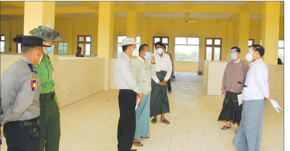
ပတ်ဝန်းကျင် သန့်ရှင်းသာယာလှပစေရေး၊ အရိပ်ရ သက်ဆိုင်ရာဌာနဆိုင်ရာများနှင့် ပေါင်းစပ်ညှိနှိုင်း သစ်ပင်များ စိုက်ပျိုးသွားရန်နှင့် သောက်သုံးရေ ဆောင်ရွက်ပေးခဲ့ကြောင်း သိရသည်။ ဖူလုံမှုရှိစေရေး၊ ရေစီးရေလာ ကောင်းမွန်စေရေး တင်စိုး(ပဲခူး)

ယင်းနောက် တိုင်းဒေသကြီး ဝန်ကြီးချုပ်သည် ခြောက်ထပ် ဆေးရုံအတွက် လိုအပ်သော ဆေးရုံ