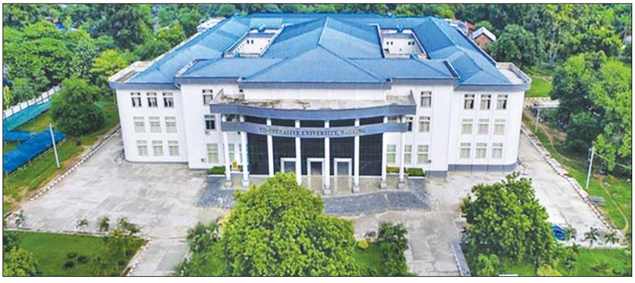
သမဝါယမနှင့် စီမံခန့်ခွဲမှုပညာတက္ကသိုလ်(စစ်ကိုင်း)။

ရာခိုင်နှုန်းအရ တိတိကျကျပြောရမယ်ဆိုရင် ၅၀ ရာခိုင်နှုန်းကနေ ၈၀ ရာခိုင်နှုန်းအထိကတော့ လုပ်ငန်းခွင်ထဲ ရောက်သွားကြတာ ဆရာ။