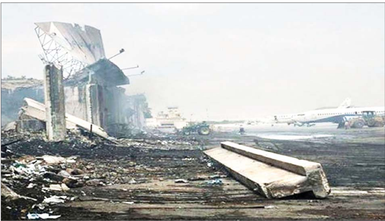
ကဘူးလ်လေဆိပ်၌ အသေခံပုံးခွဲတိုက်ခိုက်ခံရပြီးနောက် အပျက်အစီးများကို ၂၀၂၁ ခုနှစ် ဩဂုတ် ၂၇ ရက်က တွေ့ရစဉ်။

ဒီမိုကရက်တစ် အင်စတီကျူးရှင်းတွေကို ပြည်မမှာတောင် ခက်ခဲလှတဲ့အထောက်အပံ့အကူအညီအနေမှာ တောင်တန်းဒေသလူမျိုးစုတွေအထိရောက်ဖို့ဆိုတာ ဘယ်လိုမှ မဖြစ်နိုင်ခဲ့ပါဘူး။ (ဥပမာ- ရွေးကောက်ပွဲမှာ မဲပေးဖို့ အာဖဂန်လူမျိုးတွေဟာ အသက်