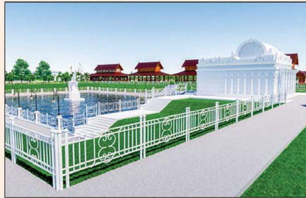
မုစလိန္နုအိုင်

၁။ နိုင်ငံတော်စီမံအုပ်ချုပ်ရေးကောင်စီဥက္ကဋ္ဌ၊ တပ်မတော်ကာကွယ်ရေးဦးစီးချုပ် ဗိုလ်ချုပ်မှူးကြီးမင်းအောင်လှိုင် ဦးဆောင်သည့် (၇)ရက်သား၊ သမီး၊ ဘုရားဒါယကာ၊ ဒါယိကာမတို့က မာရဝိဇယပုဒ္ဒရုပ်ပွားတော်မြတ်ကြီးအား မြန်မာနိုင်ငံတွင် ထေရဝါဒပုဒ္ဒသာသနာတော်ထွန်းလင်းတောက်ပလျက်ရှိသည်ကို ကမ္ဘာကိုပြသရန်၊ တိုင်းပြည်အေးချမ်းသာယာမှုရှိစေရန်၊ ရုပ်ပွားတော်မြတ်ကြီးအား ပြည်တွင်း၊ ပြည်ပဘုရားဖူးများလာရောက်ခြင်းဖြင့် ဒေသတိုးတက်စည်ကားမှုကို အထောက်အကူဖြစ်စေရန်၊ နိုင်ငံတော်ဖွံ့ဖြိုးတိုးတက်မှုအား အထောက်အကူဖြစ်စေရန် ရည်သန်လျက် ပြည်ထောင်စုနယ်မြေ နေပြည်တော်၊ ဒက္ခိဏသီရိမြို့နယ်အတွင်း၌ သာသနာတော်ထုံး၊ ရုပ်ပွားဆင်းတုတော်ထုံး၊ မြန်မာ့ရိုးရာတည်ထုံးများနှင့်အညီ တည်ဆောက်ပူဇော်လျက် ရှိပါသည်။