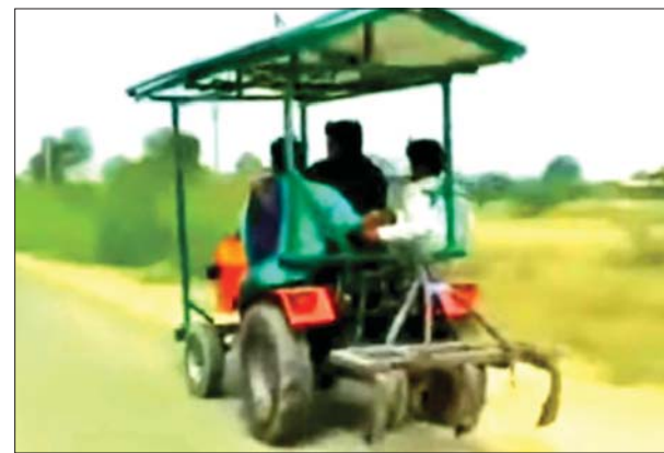
အိန္ဒိယနိုင်ငံ၌ နေရောင်ခြည်အားစွမ်းအင်ကို ထွန်စက်များတွင် အသုံးပြုထားစဉ်။

စိုက်ထုတ်အသုံးပြုနိုင်အောင် အကောင်အထည်ဖော်ပေးနိုင်ပါက ထိရောက်သော ကြိုးပမ်းမှု၏ အောင်မြင်မှုရလဒ်ဖြစ်လာမည် ဖြစ်သဖြင့် တစ်ဦးချင်းတစ်အိမ်ချင်းက အစပြုကာ တိုင်းရင်းသားပြည်သူများအားလုံးနှင့် ပြည်ထောင်စုမြန်မာနိုင်ငံတော်ကြီး ဖွံ့ဖြိုးတိုးတက်ရန်အတွက် ကျရာအခန်းမှ အားထည့်စွမ်းဆောင်ပေးကြပါရန် တိုက်တွန်းအပ်ပါသည်။