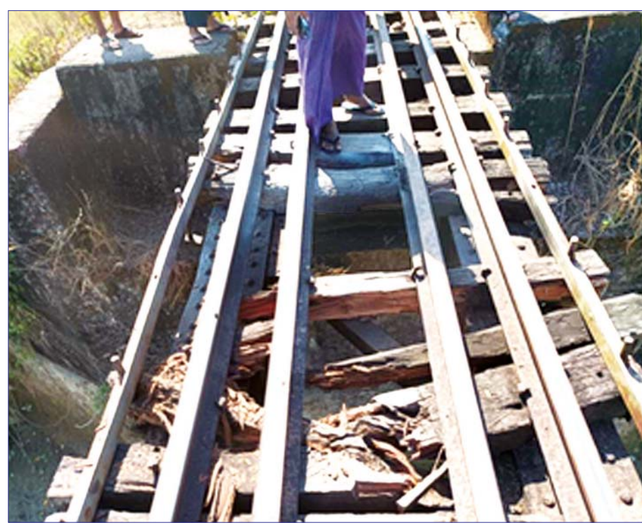
အကြမ်းဖက်သမားများ မိုင်းထောင်ဖောက်ခွဲခံရမှုကြောင့် ပျက်စီးနေသည့် ရထားသံလမ်းအား တွေ့ရစဉ်။

နေပြည်တော် ဖေဖော်ဝါရီ ၁၁ မွန်ပြည်နယ် ကျိုက်ထိုမြို့နယ်၌ လမ်းပန်းဆက်သွယ်မှု ပြတ်တောက်စေရန် ရည်ရွယ်လျက် အကြမ်းဖက် သမားများက ဖေဖော်ဝါရီ ၁၁ ရက် နံနက် ၈ နာရီခွဲတွင် ကျိုက်ထိုမြို့နယ် မရမ်းကျေးရွာ မုပွလင်ဘူတာနှင့် ကျိုက္ကသာ ဘူတာအကြားရှိ ရန်ကုန် - မော်လမြိုင်သွား ရထားလမ်းအား မိုင်းထောင်ဖောက်ခွဲဖျက်ဆီးခဲ့ကြောင်း သိရသည်။ ဖြစ်စဉ်မှာ မွန်ပြည်နယ် ကျိုက်ထိုမြို့နယ် မရမ်းကျေးရွာ မုပွလင်ဘူတာနှင့် ကျိုက္ကသာ ဘူတာအကြားရှိ ရန်ကုန်-မော်လမြိုင်သွား ရထားလမ်း သံလမ်းကူးတံတား အမှတ် ၃၈ (ပေ-၄၀) သံဖရိုန့်တံတား၌ စာမျက်နှာ ၁၈ ကော်လံ ၁ ❖