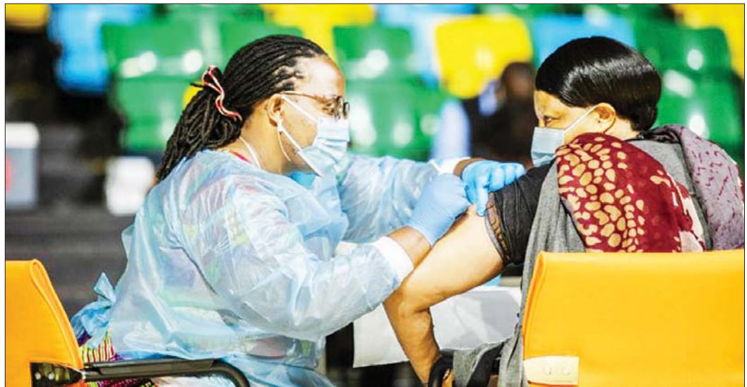
အာဖရိကနိုင်ငံတစ်ခုတွင် ကိုဗစ်-၁၉ ကာကွယ်ဆေးထိုးပေးနေသည်ကို တွေ့ရစဉ်။

များက ကာကွယ်ဆေးမညီမျှခြင်းသည် ကိုဗစ်-၁၉ ကပ်ရောဂါကို သက်ဆိုး ရှည်စေကြောင်း သတိပေးထားသည်။ ကမ္ဘာတစ်ဝန်း လူဦးရေ ၅၄ ရာခိုင်နှုန်း နီးပါး ကိုဗစ်-၁၉ ကာကွယ်ဆေးအပြည့် အထိုးနှံပြီးပြီဖြစ်သည်။