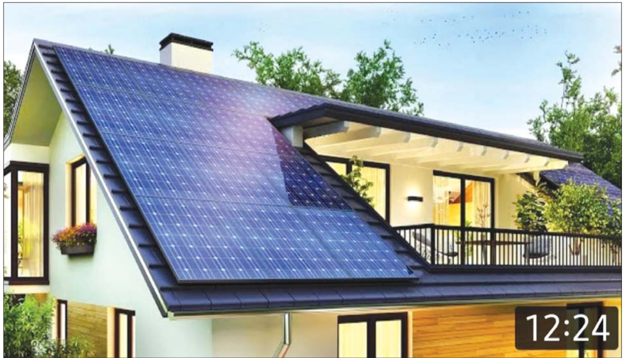
နေအိမ်အတွက် နေရောင်ခြည်အားစွမ်းအင်ကို အသုံးပြုထားပုံ။

လူသားများအားလုံးက မူလအစကနဦးတွင် တီထွင်အောင်မြင်ခဲ့သော လောင်စာဆီသုံး (Internal Combustion Engine - ICE) စွမ်းအင်ကိုအသုံးပြုကြကာ မိမိတို့ စွမ်းအားလိုအပ်သည့်နေရာများတွင် အသုံးပြုလုပ်ငန်းများဖွံ့ဖြိုးတိုးတက်စေရန် ဖော်ဆောင်လာနိုင်ခဲ့ကြပါသည်။ တိုးချဲ့သုံးစွဲလာမှု များပြားလာကြပြီး ကာလကြာမြင့်စွာ သုံးစွဲလာခြင်းတို့ကြောင့် အမြောက်အမြား ထွက်ပေါ်လာသော ညစ်ညမ်းလောင်ကျွမ်းစာတိတ်ငွေ့များ၏ ဆိုးရွားမှုများသည် သတ္တဝါများနှင့် လူသားတို့၏ ပတ်ဝန်းကျင်ကို ထိခိုက်ပျက်စီးမှုများစွာ ဖြစ်ပေါ်စေပါသည်။ ၎င်းကို ကျော်လွှားနိုင်စေရန် လောင်စာဆီသုံး (ICE) အင်ဂျင်သုံးသည့် ခေတ်ကို အစားထိုးဖြည့်ဆည်းပေးနိုင်မည့် လျှပ်စစ်စွမ်းအင်သုံး Electric Vehicle (EV) ယာဉ်များကို သုတေသနပြု အောင်မြင်စွာတီထွင် အသုံးပြုလာနိုင်ကြပြီဖြစ်ပါသည်။