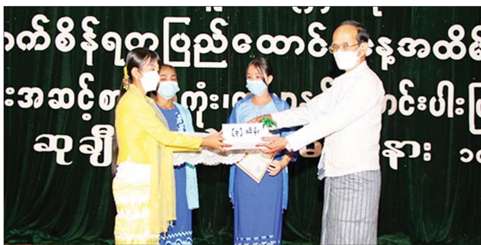
ကွန်ပျူတာတက္ကသိုလ်(တောင်ငူ) နှင့် တောင်ငူပညာရေးဒီဂရီ ခုတိယပါမောက္ခချုပ်၊ ကျောင်းအုပ် ကြီးများနှင့် တောင်ငူတက္ကသိုလ်မှ