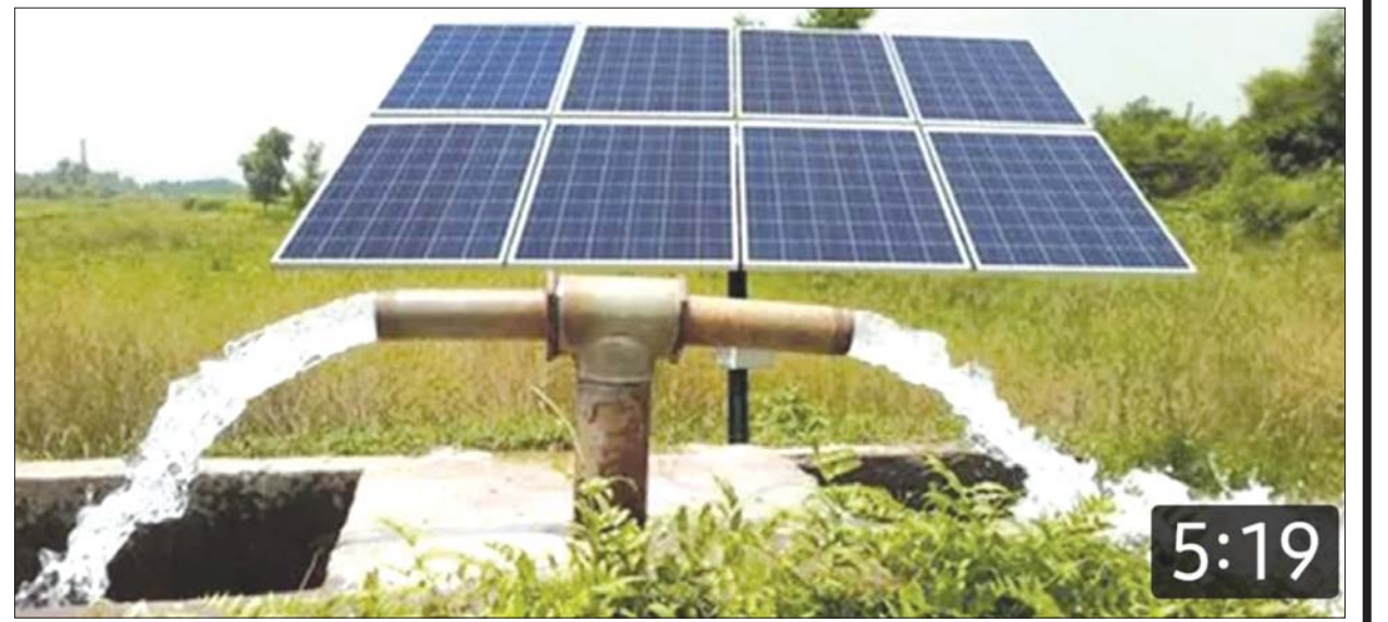
နေရောင်ခြည်အားစွမ်းအင်ဖြင့် ရေတင်ပန်လည်ပတ်၍ ရေတင်ထားစဉ်။

တိုင်းပြည်အတွက်လိုအပ်သော လျှပ်စစ်စွမ်းအား ပြည့်ပြည့်ဝဝ အစဉ်ရရှိနိုင်ရေးအတွက် နေရာတိုင်းတွင် နေရောင်ခြည်အားစွမ်းအင်ဖြင့် အစားထိုးမှုအောင်မြင်စွာ လုပ်ဆောင်လာနိုင်ကြမည်ကို ဝမ်းသာအားရစွာဖြင့် ကြိုဆိုကာ မြန်မာပြည်နေရာအနှံ့အပြားတွင် စုပေါင်းအင်အားဖြင့် နေရောင်ခြည်အားစွမ်းအင် (Solar Power) ကို ဝါယမ