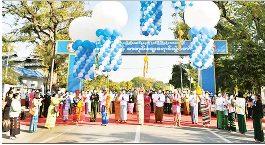
မန္တလေးတိုင်းဒေသကြီး ဝန်ကြီးချုပ် ဦးမောင်ကို (၇၅)နှစ်မြောက် စိန်ရတုပြည်ထောင်စုနေ့ အထိမ်းအမှတ် စာအုပ်ဈေးရောင်းပွဲတော်အခမ်းအနား တက်ရောက်ဖွင့်လှစ်စဉ်။

မန္တလေး ဖေဖော်ဝါရီ ၁၁ (၇၅)နှစ်မြောက် စိန်ရတု ပြည်ထောင်စုနေ့ အထိမ်းအမှတ် မန္တလေးတိုင်းဒေသကြီး စာအုပ်ပြပွဲနှင့် စာအုပ်ဈေးရောင်းပွဲတော် ဖွင့်ပွဲအခမ်းအနားကို ယမန်နေ့ နံနက် ၉ နာရီက ချမ်းအေးသာစံမြို့နယ် ၇၁ လမ်း ၂၆ လမ်းနှင့် ၂၇ လမ်းအကြား မင်္ဂလာမုခ်ဦး ဌာနအုပ်ချုပ်ရေးအဖွဲ့ဝန်ကြီးချုပ် ဦးမောင်ကို တိုင်းဒေသကြီး ဝန်ကြီးများ၊ အလယ်ပိုင်းတိုင်းစစ်ဌာနချုပ် ဒုတိယတိုင်းမှူး၊ ဌာနဆိုင်ရာများ၊ ဘင်္ဂလားတပ်ဖွဲ့ဝင်များနှင့် စာပေဝါသနာရှင်များ တက်ရောက်ကြသည်။ အခမ်းအနားတွင် တိုင်းဒေသကြီးဝန်ကြီးချုပ် ဦးမောင်ကို၊ တိုင်းဒေသကြီး စီးပွားရေးရာဝန်ကြီး ဦးသိန်းဌေး၊ လူမှုရေးရာဝန်ကြီး ဦးယဉ်ထွေးနှင့် အလယ်ပိုင်းတိုင်းစစ်ဌာနချုပ် ဒုတိယတိုင်းမှူး ဗိုလ်မှူးကြီး အောင်ဇော်ထွေးတို့က စာအုပ်ပြပွဲနှင့် စာအုပ်ဈေးရောင်းပွဲတော်ကို ဖွင့်ပွဲဖြင့်လှစ်ပေးကြပြီး တက်ရောက်လာသူများနှင့်အတူ စုပေါင်း၍