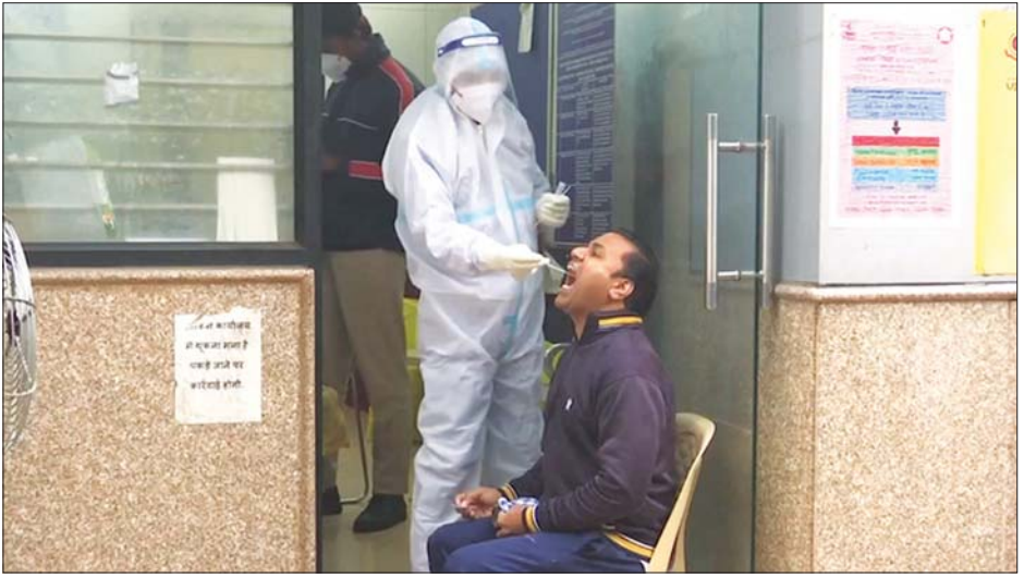
အိန္ဒိယနိုင်ငံ၌ ကိုဗစ် -၁၉ ဆေးစစ်နေစဉ်။