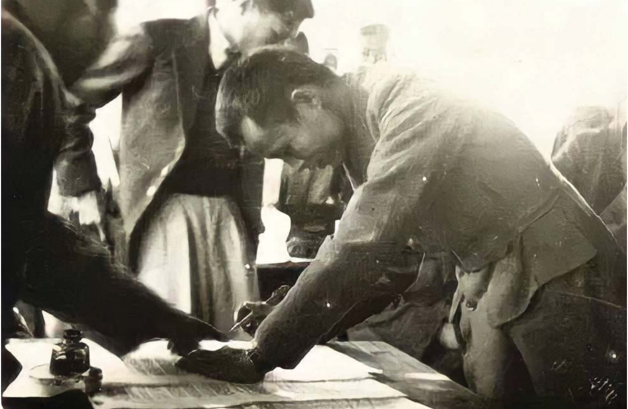
မြန်မာ့လွတ်လပ်ရေးအတွက် တိုင်းရင်းသားစည်းလုံးညီညွတ်မှုကိုဖော်ပြသည့် ပင်လုံစာချုပ်တွင် ဗိုလ်ချုပ်အောင်ဆန်း လက်မှတ်ရေးထိုးစဉ်။

ပြည်ထောင်စုအတွက် စည်းလုံးညီညွတ်မှုဟုဆိုလျှင် ယင်းနှင့် အတူ ယုံကြည်မှုတည်ဆောက်ရေးနှင့် အမျိုးသားရင်ကြားစေရေး တို့မှာလည်း ဒွန်တွဲ၍ ပါဝင်နေပါသည်။ ယုံကြည်မှုနှင့် အမျိုးသားရင်ကြားစေရေး မပါဝင်ဘဲ စည်းလုံးမှုတည်ဆောက်နိုင်မည် မဟုတ်ချေ။ တိုင်းရင်းသားညီအစ်ကိုမောင်နှမများအကြား စည်းလုံးညီညွတ်မှုရရှိရန် ဖြစ်ပေါ်လာသော ပဋိပက္ခများကို ဖြေရှင်းကြရာတွင် ယုံကြည်မှုတည်ဆောက်ရေးနှင့် အမျိုးသားပြန်လည်ရင်ကြားစေရေးကို ဦးတည်ကြရပါသည်။