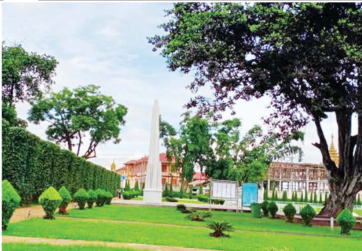
မြန်မာနိုင်ငံလွတ်လပ်ရေး ဘူမိနက်သန် ပင်လုံစာချုပ်ချုပ်ဆိုသည့် ပင်လုံမြေမှ အထိမ်းအမှတ်ကျောက်တိုင်။

“သမိုင်းစဉ်ဆက် ဥမကွဲသိုက်မပျက် နေထိုင်လာခဲ့ကြသော ပြည်ထောင်စု မြန်မာနိုင်ငံသည် ပြည်ထောင်စုသားအားလုံး၏ နေအိမ်ဖြစ်ပါသည်။ မိသားစု တစ်ခုအနေဖြင့်ဆိုလျှင် ညီရင်းအစ်ကိုမောင်ရင်းနှမများ စုစည်းနေထိုင် ကြသော အိမ်ကြီးဖြစ်ပါသည်။ မိသားစုအတွင်း အိမ်တွင်းရေးပြဿနာများ၊ တစ်ဦးနှင့် တစ်ဦးအကြား မကျေနပ်မှုများ ဖြစ်ပွားတတ်ကြသည်မှာ သဘာဝဖြစ်ပါသည်။ ဖြစ်တတ်သည့် အိမ်တွင်းရေး ပြဿနာများရှိစေကာမူ တစ်ဦးနှင့် တစ်ဦး၊ တစ်ဖက်နှင့်တစ်ဖက် မိသားစုစိတ်ဓာတ်ဖြင့် ပြေလည်စွာ ဖြေရှင်းကြမည်ဆိုလျှင် ထာဝစဉ်ပျော်ရွှင်အေးချမ်းသော မိသားစု အိမ်ကြီး ဖြစ်နေပါလိမ့်မည်။ အိမ်မြန်မာပြည်အတွင်း တစ်မြေတည်းနေ တစ်ရေတည်း သောက်နေကြသည့် ပြည်ထောင်စုဖွား တိုင်းရင်းသားအားလုံးသည် ညီရင်း အစ်ကို မောင်ရင်းနှမများပင် မဟုတ်ပါလား။”