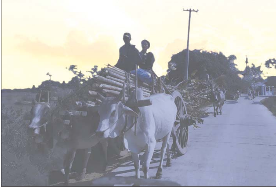
ထင်းခုတ်ရာသီတွင် မကြာခဏတွေ့ရလေ့ရှိသော ထင်းလှည်းများကို ဤသို့တွေ့ရသည်။

ကျွန်တော်မှတ်သားမိသလောက် ပြည်ထောင်စု မြန်မာနိုင်ငံ၌ ပထမဆုံးအကြိမ် ဥယျာဉ်စိုက်မင်္ဂလာ ပွဲကို ၁၉၅၄ ခုနှစ် ဇွန် ၂ ရက်က ရန်ကုန်မြို့ ကန်တော်ကြီး ဗိုလ်ချုပ်အောင်ဆန်း ဥယျာဉ်၌ အိုးစည်ဗိုလ်မှူးသံတည့်ဖြင့် စည်ကားသိုက်မြိုက် စွာ ကျင်းပခဲ့ကြောင်း မှတ်သားဖူးပါသည်။ ထိုစဉ်က နိုင်ငံတော်သမ္မတကြီး ဒေါက်တာဦးဘဦးနှင့် နိုင်ငံတော်ဝန်ကြီးချုပ် ဦးနုတို့ ကိုယ်တိုင် သစ်ပင်များ တက်ရောက်စိုက်ပျိုးပေးခဲ့ကြောင်း၊ ထိုနှစ်တွင် နိုင်ငံ တစ်ဝန်း စိုက်ပျိုးရေးဌာနက ဦးဆောင်၍ ငွေကျပ် ၄၃ သိန်း အကုန်အကျခံကာ သစ်ပင်ပေါင်း သိန်းနှင့် ချီ၍ စိုက်ပျိုးခဲ့ကြောင်း သိရသည်။ ထိုခေတ်ထိုအခါမှ စ၍ တွက်ကြည့်လျှင် မြန်မာနိုင်ငံ၌ မိုးရာသီကာလ ရောက်တိုင်း ခေတ်အဆက်ဆက် စိုက်ပျိုးလာခဲ့ သည်မှာ နှစ်ပေါင်းကြာညောင်းခဲ့လေပြီ။