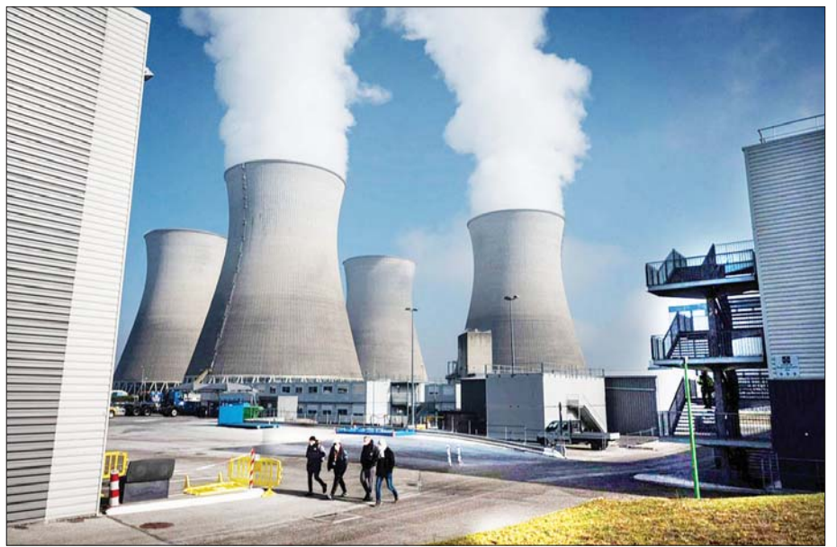
ပြင်သစ်နိုင်ငံအရှေ့ပိုင်းရှိ Bugey နျူကလီးယားဓာတ်အားပေးစက်ရုံကို တွေ့ရစဉ်။