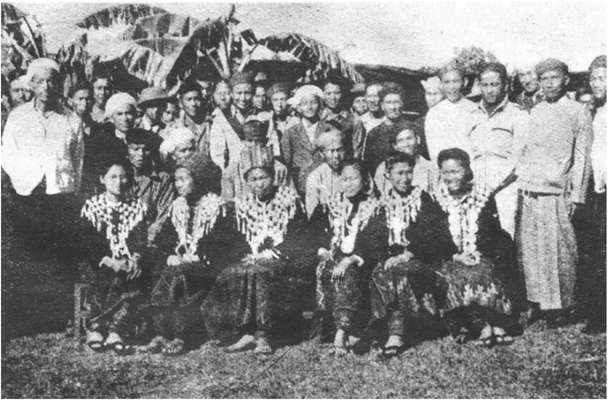
ပင်လုံစာချုပ် မချုပ်ဆိုမီ ဗိုလ်ချုပ်အောင်ဆန်းနှင့် တိုင်းရင်းသား တိုင်းရင်းသူများ၏ မှတ်တမ်းဓာတ်ပုံ။

ပြည်ထောင်စု၏ အမှတ်သရုပ်သည် အားလုံးပါဝင်သော စည်းလုံးညီညွတ်မှု ဖြစ်ပါသည်။ ၁၉၄၇ ခုနှစ်၊ ဖေဖော်ဝါရီလ ၁၂ ရက်နေ့က ရှမ်းပြည်နယ်တောင်ပိုင်း ပင်လုံမြို့၌ ဗိုလ်ချုပ်အောင်ဆန်းနှင့်တကွ တိုင်းရင်းသားခေါင်းဆောင်များ ပါဝင် လက်မှတ်ရေးထိုးခဲ့ကြသည့် ပင်လုံစာချုပ်သည် တိုင်းရင်းသားများ၏ စည်းလုံးညီညွတ်မှု အမှတ်လက္ခဏာ ဖြစ်ပါသည်။ မြန်မာ့လွတ်လပ်ရေးအတွက် တိုင်းရင်းသား စည်းလုံးညီညွတ်မှုကို ပင်လုံစာချုပ်ဖြင့် ကတိကဝတ်ပြုခဲ့ကြသည်။ ပင်လုံစာချုပ်ကို အမျိုးမျိုးသော အခက်အခဲများကြားမှ သဘောတူချုပ်ဆိုခဲ့ရသည်။ လွယ်လွယ်ကူကူရရှိလာခဲ့သည့် စုပေါင်းအင်အားမဟုတ်ချေ။ သို့ဖြစ်ရာ မိမိတို့ နိုင်ငံ၏ စည်းလုံးခြင်းအမှတ်လက္ခဏာ ပင်လုံစာချုပ် ချုပ်ဆိုသည့်နေ့ကို ပြည်ထောင်စုနေ့အဖြစ် နှစ်စဉ်ကျင်းပလာခဲ့သည်။ သို့ဖြစ်ရာ ပြည်ထောင်စုနေ့၏ အနှစ်သာရ သဘောတွင် တိုင်းရင်းသားအားလုံးကို ကိုယ်စားပြုသော စည်းလုံးမှု ခွန်အားများ ကိန်းအောင်းပါဝင်နေပေသည်။