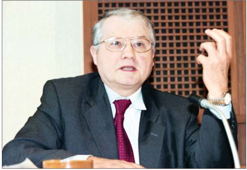
ပြင်သစ် သိပ္ပံပညာရှင် လုခိမွန်တေးနီးယား။