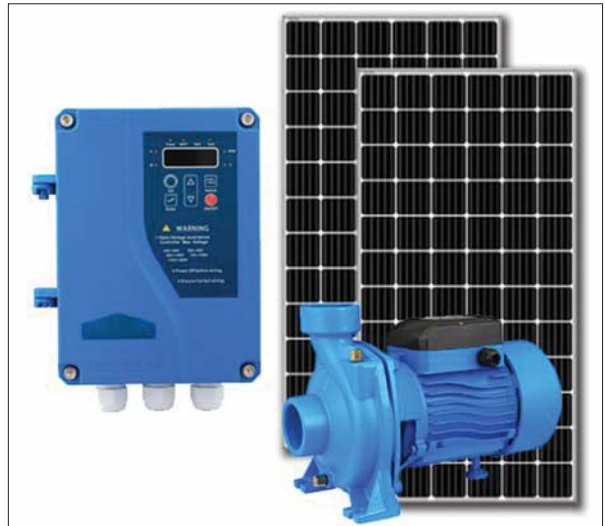
နေရောင်ခြည်အားစွမ်းအင်သုံး ရေတင်ပန်။