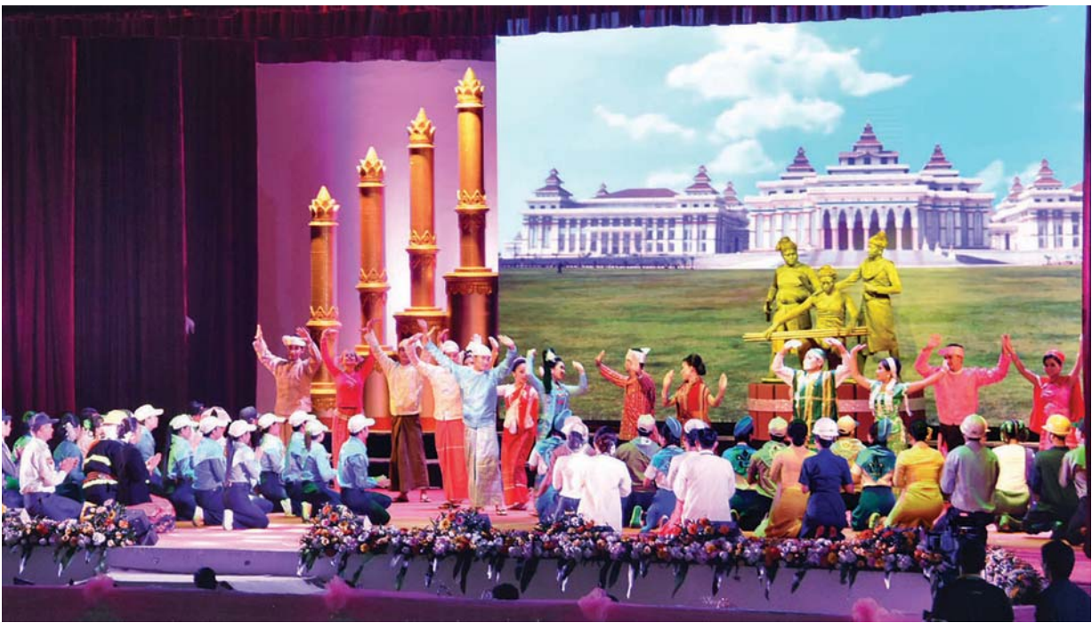
၁၂-၂၀၁၇ ရက်က ကျင်းပသည့် နှစ် (၇၀) မြောက် ပြည်ထောင်စုနေ့ အခမ်းအနားတွင် တိုင်းဒေသကြီးနှင့် ပြည်နယ်အသီးသီးတို့မှ ယဉ်ကျေးမှုအဖွဲ့များက တိုင်းရင်းသားရိုးရာ အကပဒေသာများဖြင့် ဖျော်ဖြေတင်ဆက်ကြစဉ်။

မတူကွဲပြားမှုများဖြင့် စည်းလုံးညီညွတ်ခြင်း Unity in Diversity သည် မတူကွဲပြားသော တစ်ဦးချင်း သို့မဟုတ် အုပ်စုများအကြား သဟဇာတဖြစ်မှုနှင့် စည်းလုံးညီညွတ်မှုဟု ဆိုပါသည်။ တူညီမှုမရှိဘဲ စည်းလုံးမှု Unity without uniformity နှင့် ပြိုကွဲမှု မရှိဘဲ ကွဲပြားမှု Diversity without fragmentation သဘောကို နားလည်လက်ခံ၍ လက်တွဲဆောင်ရွက်ကြမည်ဆိုလျှင် ပြည်ထောင်စု ဤခရီး နီးပါလိမ့် မည်။ ထို့အတူ စိန်ရတုပြည်ထောင်စုနေ့မှသည် ကမ္ဘာတည်သရွေ့ ပြည်ထောင်စုနေ့များတိုင် အခွန်ရှည်သော ပြည်ထောင်စုနိုင်ငံကြီး အဖြစ် ဝင့်ထည်စွာ ရပ်တည်နိုင်မည်ဖြစ်ပါသည်။ ။