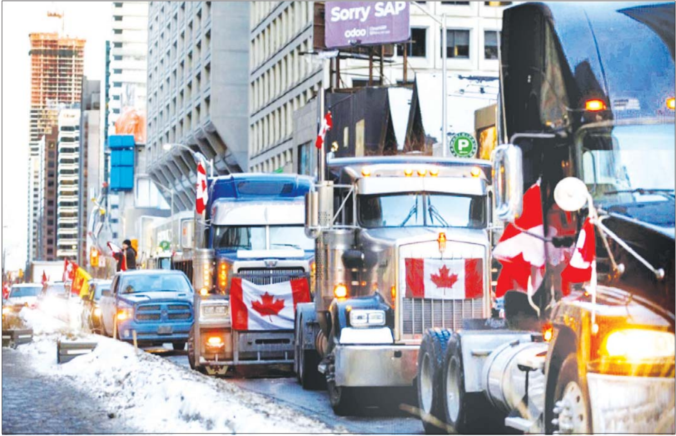
ကိုဗစ် -၁၉ ကျန်းမာရေးကန့်သတ်ချက်များကို တစ်စိတ်တစ်ပိုင်း ဆန္ဒပြမှုများအနေဖြင့် တိုက်ခိုက်မြို့လမ်းမထက်တွင် ထရပ်ကားများအား တွေ့ရစဉ်။

ဆန္ဒပြမှုများ ကျယ်ပြန့်လာပြီး ကိုဗစ် - ၁၉ ကန့်သတ်ချက်များကို ဆန္ဒပြမှုများနှင့် ကနေဒါဝန်ကြီးချုပ်ထရူးဒို၏အစိုးရကို ဆန့်ကျင်ဆန္ဒပြမှုများ ပေါ်ပေါက်လာသည်။ ဆန့်ကျင်ဆန္ဒပြသူများ၏ စည်းရုံးရေးမှူးဖြစ်သူ တမ်မရာလစ်ချ်က တက်ကြွလှုပ်ရှားသူများမှာ ပဋိပက္ခများကို ဖြေရှင်းရန်အတွက် အစိုးရနှင့် ပူးပေါင်းဆောင်ရွက်မှု ပြုလုပ်နိုင်ရေး စိတ်ဝင်စားကြသည်ဟု ပြောသည်။ သို့သော်လည်း ကိုဗစ် - ၁၉ ကန့်သတ်ချက်များကို ဖြေလျှော့ပေးနိုင်ရေးကို ဦးစွာလုပ်ကိုင်ရမည်