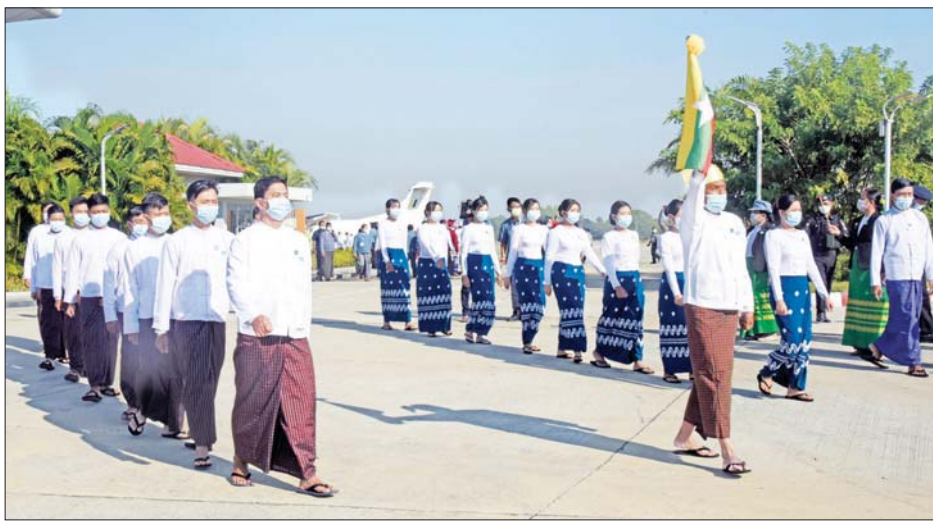
ဒုတိယဝန်ကြီး ဦးရဲတင့်နှင့် ဝန်ထမ်းများက နေပြည်တော်အပြည်ပြည်ဆိုင်ရာလေဆိပ်မှ ပြည်ထောင်စု အလံတော်ကို လက်ဆင့်ကမ်း သယ်ဆောင်လာစဉ်။

သောင်းသောင်းဖြဖြကြိုဆို ပြည်ထောင်စုအလံတော်အား ရန်ကုန်မြို့တော်ခန်းမမှ ဆူးလေဘုရားလမ်း၊ ဂျိုးဖြူလမ်း၊ ကမ္ဘာအေးဘုရားလမ်း၊ ပြည်လမ်းမ တစ်လျှောက် ရန်ကုန်အပြည်ပြည်ဆိုင်ရာလေဆိပ်သို့ အဆင့်ဆင့် သယ်ဆောင်ရာ လမ်းတစ်လျှောက် တိုင်းရင်းသား ပြည်သူများ၊ တပ်မတော်သားများနှင့် မိသားစုဝင်များ၊ မြန်မာနိုင်ငံ မီးသတ်တပ်ဖွဲ့ဝင်များ၊ မြန်မာနိုင်ငံ