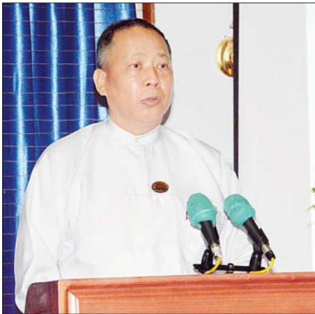
ပြည်ထောင်စုရွေးကောက်ပွဲကော်မရှင်အဖွဲ့ဝင် ဦးခင်မောင်ဦး ရှင်းလင်းပြောကြားစဉ်။

အောင်လင်းဒွေး ဒုတိယဗိုလ်ချုပ်ကြီး အတွင်းရေးမှူး