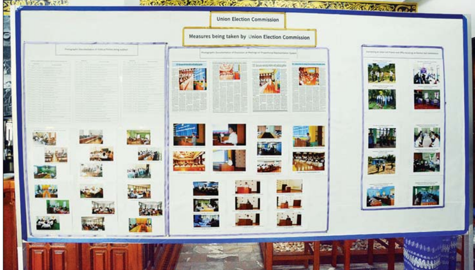
သံတမန်များနှင့် ကုလသမဂ္ဂ ဌာနကိုယ်စားလှယ်တို့အား လက်ရှိပြည်တွင်းရေး ဖြစ်ပေါ်တိုးတက်မှုများကို ရှင်းလင်းပွဲတွင် ခင်းကျင်းပြသထားသည့် မှတ်တမ်းဓာတ်ပုံများ။

ထို့နောက် အမေးအဖြေကဏ္ဍကို ဆောင်ရွက် သည့် ရှင်းလင်းပြောကြားမှု အစီအစဉ်ပြီးနောက် တက်ရောက်လာသူများက ခင်းကျင်းပြသထားသည့် မှတ်တမ်းဓာတ်ပုံများ၊ အချက်အလက်များကို ကြည့်ရှုကြကြောင်း သိရသည်။ သတင်းစဉ်