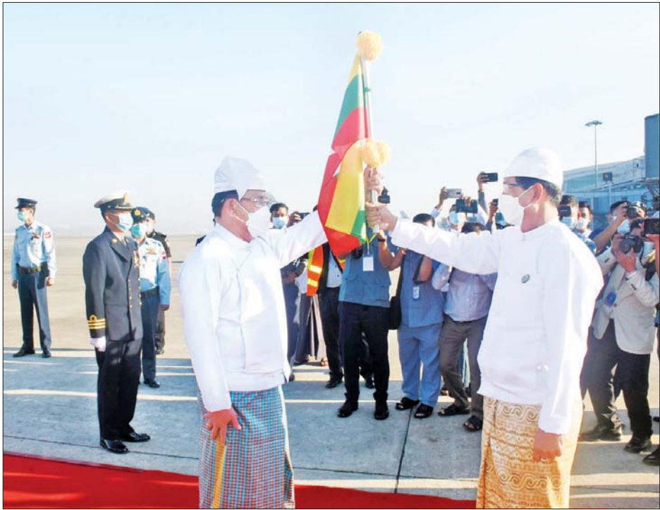
ရန်ကုန်တိုင်းဒေသကြီး ဝန်ကြီးချုပ် ဦးစိုးသိန်းက ရန်ကုန်မှ နေပြည်တော်သို့ သယ်ဆောင်မည့် ပြည်ထောင်စုအလံတော်အား ပြည်ထောင်စုဝန်ကြီး ဦးမောင်မောင်အုန်းထံ လွှဲပြောင်းပေးအပ်စဉ်။

မှု၊ ဦးစိုးစိုးဇော်၊ လမ်းပန်းကြက်ခြေနီအသင်းနှင့် ဌာနဆက်သွယ်ရေးဝန်ကြီး ရဲမှူးချုပ် ဆိုင်ရာများ၊ ကျောင်းသား၊ မျိုးမင်းထိုက်၊ တိုင်းဒေသကြီး ကျောင်းသူများက အလံငယ်များ တိုင်းရင်းသားရေးရာ ဝန်ကြီး ဝေယမ်း၍ ပြည်ထောင်စုအလံတော်အား သောင်းသောင်းဖြဖြ