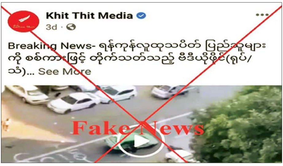
လူမှုကွန်ရက်ကို မမှန်မကန်အသုံးပြု၍ သတင်းတုသတင်းမှားများ လုပ်ကြံဖန်တီးထုတ်လွှင့်ခဲ့မှု မှတ်တမ်းဓာတ်ပုံများ။