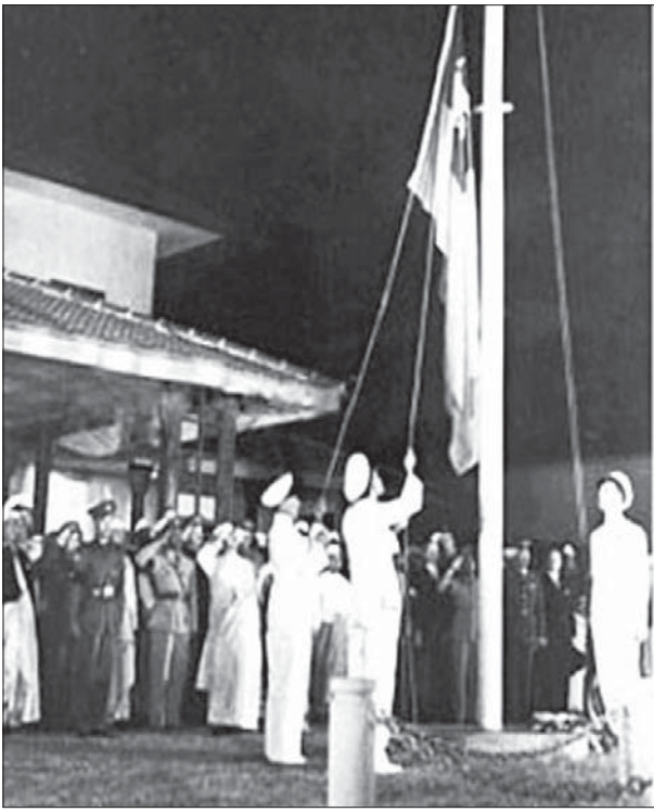
၁၉၄၈ ခုနှစ် ဇန်နဝါရီ ၄ ရက်တွင် ပထမဆုံးကျင်းပသည့် လွတ်လပ်ရေးနေ့ အလံတင်အခမ်းအနားကို တွေ့ရစဉ်။

၂၀ ရာစုပင်လုံညီလာခံကရရှိခဲ့တဲ့ ပြည်ထောင်စုစိတ်ဓာတ်နဲ့ လွတ်လပ်ရေးကိုရရှိခဲ့ကာ နိုင်ငံရေးပါတီကြီးတွေနဲ့ ပြည်သူတွေ ဟာ ပြည်ထောင်စုမြန်မာနိုင်ငံကို တည်ထောင်ခဲ့ကြတာဖြစ်ပါတယ်။ လမ်းဆုံလမ်းခွက အောင်မြင်မှုတွေရှိသလို ကသိကအောင် စိတ်အနှောင့်အယှက်တွေ ဝမ်းနည်းဖွယ် ဖြတ်ကျော်ခဲ့ကြရပါတယ်။ လွတ်လပ်ရေးနဲ့အတူကြီးပြင်းလာကြတဲ့ ပြည်တွင်းနိုင်ငံရေး အင်အားစုတွေဟာ သဟဇာတဖြစ်မလာကြဘဲ အချင်းချင်းအားပြိုင်အနိုင်ယူ ရဲဘော်