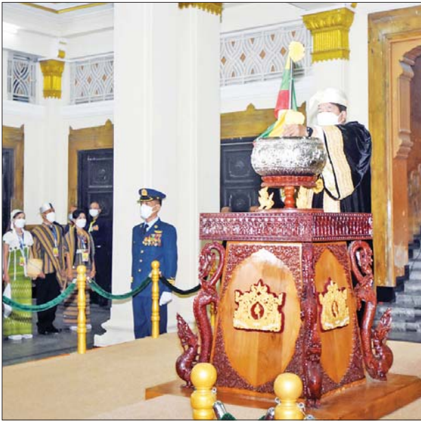
ရန်ကုန်မြို့တော် စည်ပင်သာယာရေးကော်မတီဥက္ကဋ္ဌ မြို့တော်ဝန် ဦးဗိုလ်ဌေး ပြည်ထောင်စုအလံတော်ကို ရန်ကုန်မြို့တော်ခန်းမ အလေးပြုခံစင်မြင့် ငွေဖလား၌ စိုက်ထူစဉ်။

ယင်းနောက် ပြည်ထောင်စုအလံတော်ကို ရန်ကုန်တိုင်းဒေသကြီး ဝန်ကြီးချုပ် ဦးစိုးသိန်း၊ တိုင်းဒေသကြီး လုံခြုံရေးနှင့် နယ်စပ်ရေးရာဝန်ကြီး ဗိုလ်မှူးကြီး ဝင်းတင့်၊ တိုင်းဒေသကြီး စီးပွားရေးရာဝန်ကြီး ဦးအောင်သန်းဦး၊ တိုင်းဒေသကြီး သယံဇာတရေးရာဝန်ကြီး ဦးဇော်ဝင်း၊ တိုင်းဒေသကြီး လူမှုရေးရာဝန်ကြီး ဦးအောင်ဝင်းသိန်း၊ တိုင်းဒေသကြီး တိုင်းရင်းသားရေးရာ ဝန်ကြီး စောဂျက်ကော့ထူးတို့က ဝန်ထမ်းများခြံရံ၍ အဆင့်ဆင့် လက်ဆင့်