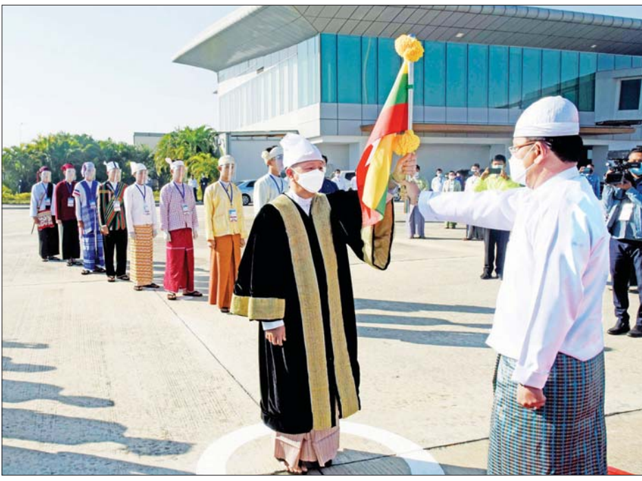
ပြည်ထောင်စုဝန်ကြီး ဦးမောင်မောင်အုန်း ပြည်ထောင်စုအလံတော်ကို နေပြည်တော် မြို့တော်ဝန် ဒေါက်တာမောင်မောင်နိုင်ထံ လွှဲပြောင်းပေးအပ်စဉ်။

ယင်းနောက် ပြည်ထောင်စု လေယာဉ်ရှေ့သို့ ရောက်ရှိရာ ပြည်ထောင်စု လေယာဉ်ရှိ ပြည်ထောင်စု အလံတော်အား ဒုတိယဝန်ကြီး ဦးဇော်အေးမောင်က ပြည်ထောင်စုအလံတော်