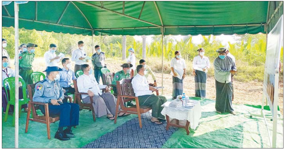
ပြည်နယ်ဝန်ကြီးချုပ် ဦးဇော်လင်းထွန်း ကုန်ထုတ်လမ်းဖောက်လုပ်မည့် လျာထားမြေပုံကို ကြည့်ရှုစစ်ဆေးစဉ်။

ကာလ လယ်ယာမြေများ ရေကြီးနစ်မြုပ်မှုမှ ကာကွယ်နိုင်ရေးအတွက် ရေလွှဲမြောင်းများ ဖောက်လုပ်ပေးခြင်းဖြစ်ကြောင်းနှင့် တောင်သူများအချိန်မီ စိုက်ပျိုးနိုင်ရေးနှင့် မျိုးကောင်းမျိုးသန့်များ စိုက်ပျိုးနိုင်ရေး မှာကြားသည်။ ထို့နောက် ပြည်နယ်ဝန်ကြီးချုပ်နှင့်အဖွဲ့သည် ကော့ပရိ-တံခွန်တိုင် ကျေးရွာချင်းဆက်မြေသားလမ်းဖောက်လုပ်သည့်နေရာသို့ ရောက်ရှိရာ ကျေးလက်လမ်းဖွံ့ဖြိုးရေးဦးစီးဌာန ပြည်နယ်မှူးက မြေသားတာပေါင်တင်ခြင်းလုပ်ငန်း ဆောင်ရွက်နေမှု အခြေအနေကို ရှင်းလင်းတင်ပြကာ ပြည်နယ်ဝန်ကြီးချုပ်က တံခွန်တိုင်ကျေးရွာအတွင်း ကတ္တရာလမ်း နှစ်မိုင်နှင့် ကုန်ထုတ်လမ်း နှစ်မိုင်ခင်းပြီးဖြစ်၍ ယခုကော့ပရိကျေးရွာမှ မြေသားလမ်း နှစ်မိုင်ခင်းကျင်းပြီးပါက အလွယ်တကူ သွားလာနိုင်မည် ဖြစ်ကြောင်း ပြောကြားပြီး တာဝန်ရှိသူများက လိုအပ်သည်များကို ပေါင်းစပ်ဖြည့်ဆည်း ဆောင်ရွက်ပေးသည်။