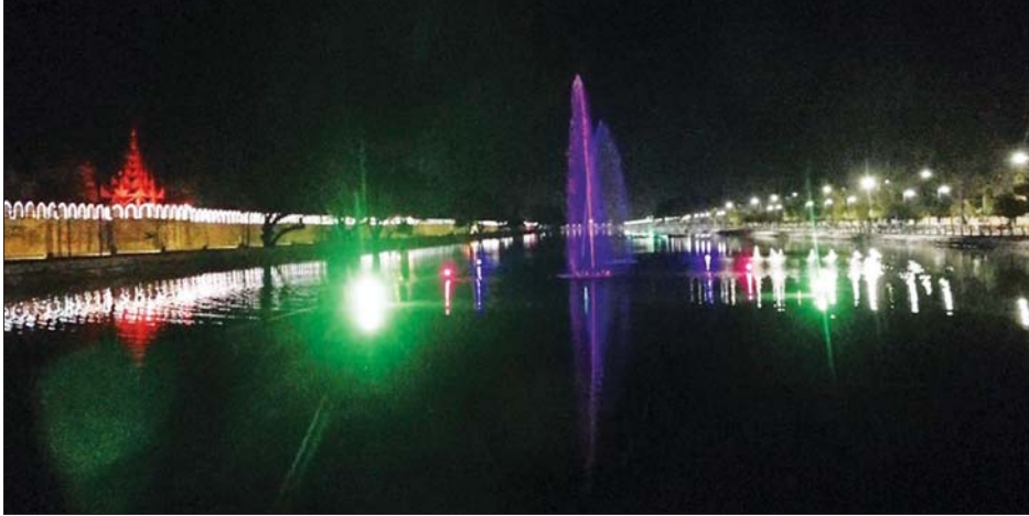
မန္တလေးမြို့ ကျုံးရှေ့၌ ရောင်စုံမီးများ ထွန်းညှိထားစဉ်။

ကြိုတင် ပြင်ဆင်မှုများအဖြစ် နေပြည်တော်ရှိ လူစည်ကားရာ လမ်းဆုံများတွင် (၇၅)နှစ်မြောက် စိန်ရတုပြည်ထောင်စုနေ့ ဂုဏ်ပြု ဆိုင်းဘုတ်များ စိုက်ထူခြင်း၊ ပြည်ထောင်စုအလံတော် သယ်ဆောင်လာမည့် ရာဇသင်္ဂဟလမ်း တစ်လျှောက်တွင် မြန်မာနိုင်ငံ တော်အလံနှင့် တိုင်းဒေသကြီး/ ပြည်နယ်များ၏ အထိမ်းအမှတ်ပါ အလံများ စိုက်ထူထားခြင်းနှင့် ယင်းလမ်းတစ်လျှောက်ရှိ အပိုင်းများတွင် လျှပ်စစ်မီးရောင်များ ထွန်းညှိထားမှုများ၊ တိုင်းရင်းသား ရုပ်ပုံကားချပ်များဖြင့် အလှဆင်ထားရှိသည်။ အလားတူ ရန်ကုန်တိုင်းဒေသ ကြီး ကျောက်တံတားမြို့နယ်ရှိ ရန်ကုန်မြို့တော်ခန်းမ၌ ဆိုင်းဘုတ်များ စိုက်ထူထားခြင်း၊ မဟာဗန္ဓုလ ပန်းခြံအတွင်း ရောင်စုံအလှမီးများ ထွန်းညှိ ပြင်ဆင်ထားခြင်း၊ ဒဂုံမြို့နယ်ရှိ ပြည်သူ့ဥယျာဉ်၌ ရောင်စုံအလှ မီးများပြင်ဆင်၍ ဂုဏ်ပြု ဆိုင်းဘုတ် စိုက်ထူထားခြင်း၊ ဦးဝိစာရအပိုင်း၊ ဗဟန်းမြို့နယ် ဦးထောင်ဘုံအပိုင်းနှင့် စမ်းချောင်း မြို့နယ် ဟံသာဝတီအပိုင်းတို့၌ ရောင်စုံမီးအလှများ ဆင်ယင်ထား ခြင်းနှင့် ဆိုင်းဘုတ်များဂုဏ်ပြု စိုက်ထူထားခြင်းများဖြင့် ကြိုတင် ပြင်ဆင်မှုများ ဆောင်ရွက်ထားကြ သည်။ ထို့အတူ မန္တလေးမြို့ ကျုံး အတွင်း ရေပန်းများ ဖွင့်လှစ်ခြင်း၊ နန်းမြို့ရိုးတစ်လျှောက်ရှိ တံတိုင်း များ၊ ကျုံးပတ်လမ်းရှိ ရတနာပုံ ဥယျာဉ်လမ်း တစ်လျှောက်နှင့် မန္တလေးမြို့တော် စည်ပင်သာယာ ရေးရုံးတို့၌လည်း ရောင်စုံမီးများ ထွန်းညှိခြင်းများ ဆောင်ရွက် ထားကြောင်း သိရှိရသည်။ ထို့ပြင် အခြားပြည်နယ်နှင့် တိုင်းဒေသကြီး အသီးသီးတွင် လည်း (၇၅)နှစ်မြောက် စိန်ရတု ပြည်ထောင်စုနေ့ကို ကြိုဆိုသည့် အနေဖြင့် ကြိုတင်ပြင်ဆင်မှု များ ဆောင်ရွက်လျက်ရှိကြောင်း သတင်းရရှိသည်။ သတင်းစဉ်