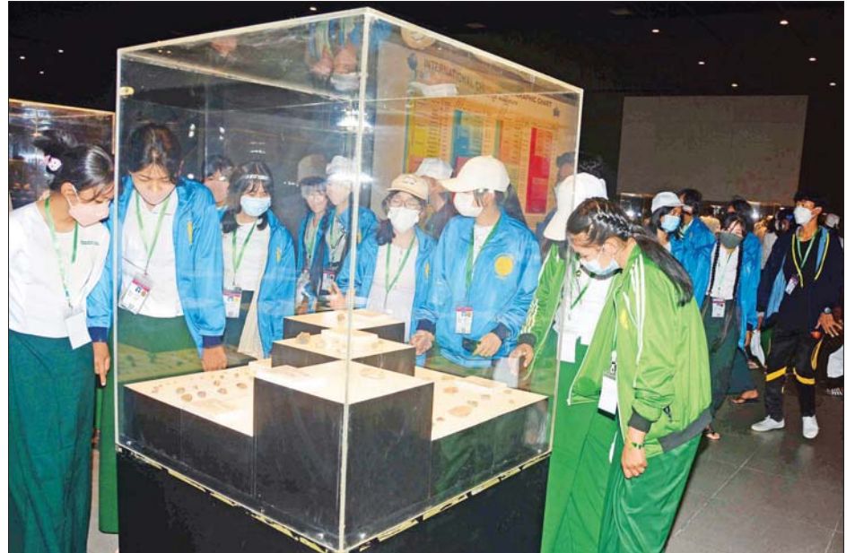
(၇၅) နှစ်မြောက် စိန်ရတုပြည်ထောင်စုနေ့ ဂုဏ်ပြုအခမ်းအနားတွင် တိုင်းဒေသကြီးနှင့် ပြည်နယ်များ၏ အမည်စာလုံးစာသားသရုပ်ဖော်နှင့် ဘင်ခရာအဖွဲ့တို့တွင် ပါဝင်သည့် ကျောင်းသား ကျောင်းသူများ အမျိုးသားပြတိုက် (နေပြည်တော်)၌ လေ့လာကြစဉ်။