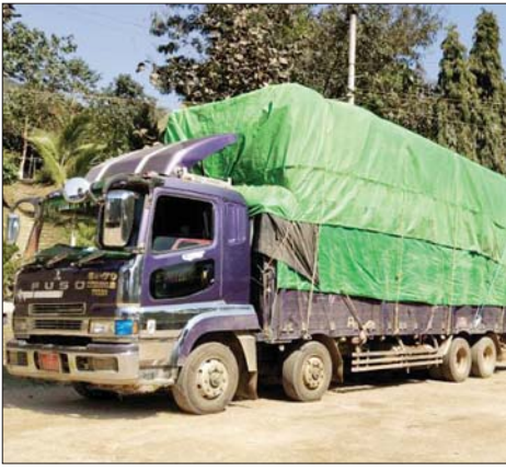
ဖြင့် နှာခေါင်းစည်း (Mask) ၃၉ တန်ကို တင်သွင်းခဲ့ကြောင်း ကိုဗစ်-၁၉ ရောဂါ ကာကွယ်၊

နေပြည်တော် ဖေဖော်ဝါရီ ၈ စီးပွားရေးနှင့် ကူးသန်းရောင်းဝယ်ရေးဝန်ကြီးဌာနအနေဖြင့် ကိုဗစ်-၁၉ ရောဂါ ကာကွယ်၊ ထိန်းချုပ်၊ ကုသရေးဆိုင်ရာ ပစ္စည်းများကို လေကြောင်း၊ ပင်လယ်ရေကြောင်းနှင့် နယ်စပ်ကုန်သွယ်ရေးစခန်းများမှ နှောင့်နှေးကြန့်ကြာမှုမရှိ တင်သွင်းနိုင်ရေးအတွက် အချိန်နှင့်တစ်ပြေးညီ စီစဉ်ဆောင်ရွက်ပေးလျက်ရှိရာ ယနေ့တွင် ချင်းရွှေဟော်ကုန်သွယ်ရေး စခန်းမှ ကုမ္ပဏီတစ်ခု ယာဉ်စီးရေလေးစီး