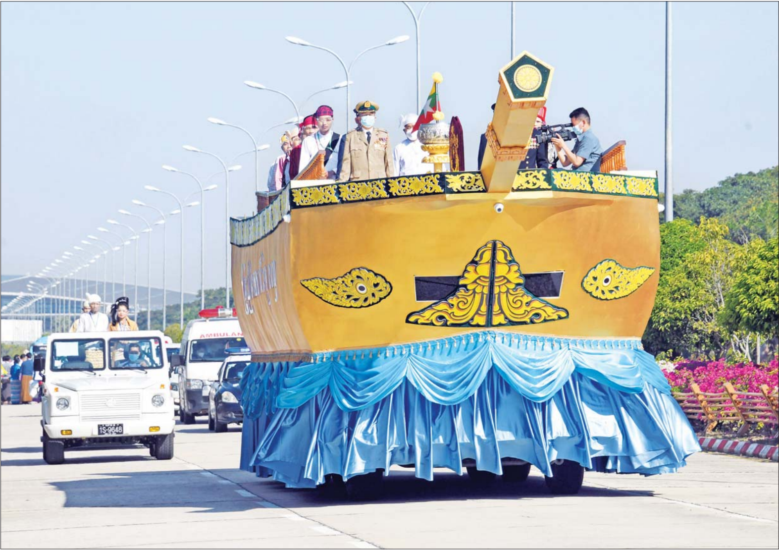
ပြည်ထောင်စုအလံတော်ကို နေပြည်တော်အပြည်ပြည်ဆိုင်ရာလေဆိပ်မှ နေပြည်တော်မြို့တော်ခန်းမသို့ ပြည်ထောင်စုနေ့ဖြင့် သယ်ဆောင်လာစဉ်။

ရန်ကုန် ဖေဖော်ဝါရီ ၈ ၂၀၂၂ ခုနှစ် (၇၅) နှစ်မြောက် စိန်ရတုပြည်ထောင်စုနေ့ ဂုဏ်ပြုအခမ်းအနား၌ အလေးပြုခြင်းခံယူမည့် ပြည်ထောင်စုအလံတော်အား ရန်ကုန်မြို့မှ နေပြည်တော်သို့ သယ်ဆောင်ခြင်းအခမ်းအနားကို ယနေ့နံနက်ပိုင်းတွင် ကိုဗစ်-၁၉ ရောဂါဆိုင်ရာ စည်းမျဉ်းစည်းကမ်းများနှင့်အညီ ကျင်းပသည်။ ရှေးဦးစွာ ရန်ကုန်မြို့တော်ခန်းမ ဧည့်ခန်းမရှိ ငွေဖလားတွင် စိုက်ထူထားသော ပြည်ထောင်စုအလံတော်အား ရန်ကုန်မြို့တော်စည်ပင်သာယာရေး ကော်မတီဥက္ကဋ္ဌ မြို့တော်ဝန် ဦးဗိုလ်ဌေးက တပ်မတော် (ကြည်း၊ ရေ၊ လေ) နှင့် မြန်မာနိုင်ငံ ရဲတပ်ဖွဲ့တို့ ပါဝင်သည့် အလံစောင့်အဖွဲ့နှင့် တိုင်းရင်းသား တိုင်းရင်းသူများ ခြံရံသယ်ဆောင်၍ မြို့တော်ခန်းမ အလေးပြုခံစင်မြင့် ငွေဖလား၌ စိုက်ထူသည်။ ထို့နောက် ရန်ကုန်တိုင်းဒေသကြီး ဝန်ကြီးချုပ်နှင့် အစိုးရအဖွဲ့ဝင်များ၊ ရန်ကုန်မြို့တော် စည်ပင်သာယာရေးကော်မတီ ဥက္ကဋ္ဌနှင့် စာမျက်နှာ ၃ ကော်လံ ၁၀