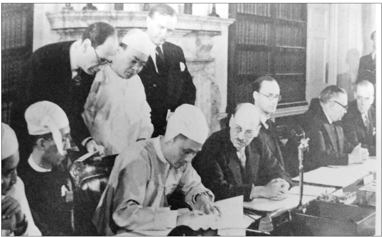
၁၉၄၇ ခုနှစ် အောက်တိုဘာ ၁၇ ရက်နေ့တွင် န- အက်တလီစာချုပ်ကို ဦးနုလက်မှတ်ရေးထိုးစဉ်။

ခါကာဘိုရာဇီတောင်ထိပ်မှသည် ရခိုင်ရိုးမ၊ ပဲခူးရိုးမ၊ ရှမ်းကုန်းပြင်မြင့် စတဲ့ တောင်တန်းကြီးများ၊ ဧရာဝတီ၊ သံလွင်၊ စစ်တောင်း၊ ချင်းတွင်း၊ ဒုဋ္ဌဝတီ၊ ဇော်ဂျီ၊ ပန်းလှိုင်မြစ်စဉ်မြစ်ကြောင်း မြန်မာ့ပင်လယ်ပြင်နဲ့ ကမ်းရိုးတန်းအရေးတွေကို မျှော်တွေးမမြင်နိုင်လောက်အောင် မြန်မာပြည်သူတွေနဲ့ ခေါင်းဆောင်တွေဟာ