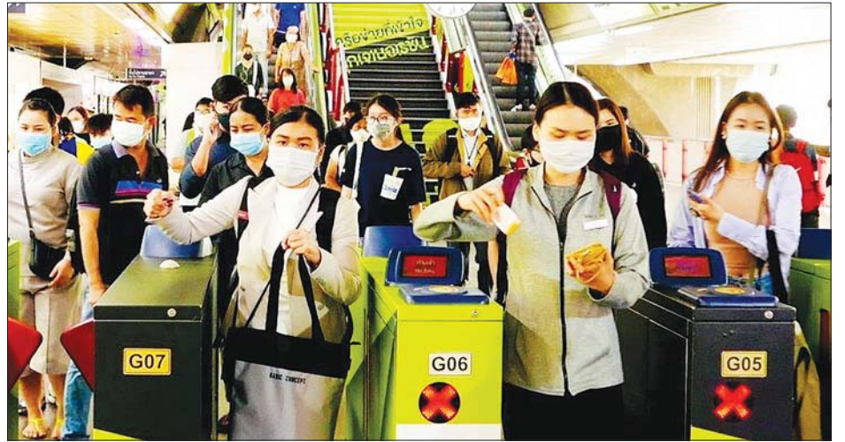
ထိုင်းနိုင်ငံတွင် ကိုဗစ်-၁၉ ကြောင့် စီးပွားရေးနှင့်လူမှုရေးအပေါ် အကျိုးသက်ရောက်လာနိုင်မှုကို လျော့ချ လာနိုင်ရန်နှင့် အလုပ်သမားထုကို တည်ငြိမ်စေရန် လူမှုကာကွယ်ရေးအစီအစဉ်များကို အသုံးပြုထားသည့် ထိုင်းနိုင်ငံသားများကို တွေ့ရစဉ်။

နိုင်ငံအတွင်းကိုဗစ်-၁၉ ကူးစက်ဖြစ်ပွားသူပေါင်း ၂ ဒသမ ၅ သန်းအထိ မြင့်တက်လာခဲ့ပြီး သေဆုံး သူပေါင်းမှာလည်း ၂၂၃၀၃ ဦးရှိသည်။ ဆင်ဟွာ