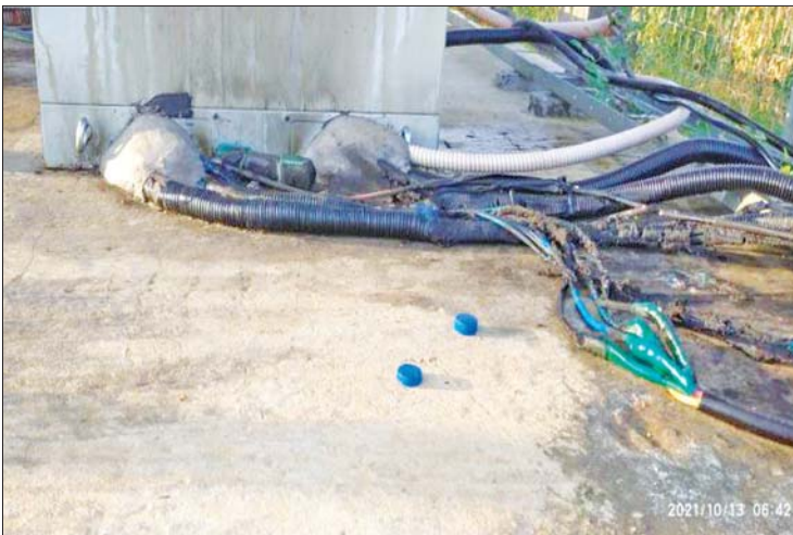
၂၀၂၁ ခုနှစ် အောက်တိုဘာ ၁၃ ရက်က ဝမ်းတွင်းမြို့နယ် သုံးဒေါင့်အိုင်ကျေးရွာအနီး Mytel ဆက်သွယ်ရေးတာဝါတိုင် ဖျက်ဆီးခံရသည့် မှတ်တမ်းဓာတ်ပုံ။