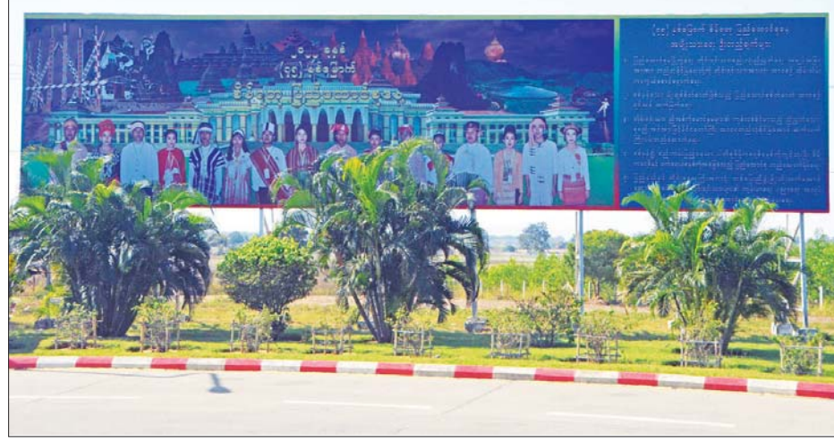
နေပြည်တော်၌ (၇၅)နှစ်မြောက် စိန်ရတုပြည်ထောင်စုနေ့ ဂုဏ်ပြုဆိုင်းဘုတ်များ စိုက်ထူထားစဉ်။