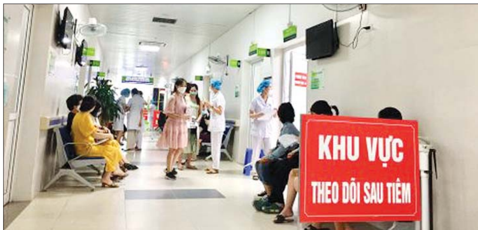
ဗီယက်နမ်နိုင်ငံ ဟန့်ဇင်းရှိ ကိုဗစ်-၁၉ ကာကွယ်ဆေးထိုးသည့်နေရာတစ်ခုကို တွေ့ရစဉ်။

နိုင်ငံအတွင်း ကိုဗစ်-၁၉ ကုသပေးသည့် ဆေးရုံပေါင်း ၁၂၀ ရှိပြီး အန္တရာယ်ဖြစ်ပွားမှုနည်းသည့် ကွာရန်တင်းစင်တာ ၄၃ ခုတွင် နောက်ထပ် ခုတင်ပေါင်း ၁၀၈၁၀ ရှိကြောင်း ၎င်းကထပ်လောင်း ပြောကြားလိုက်သည်။ မလေးရှားနိုင်ငံသည် လွန်ခဲ့သောသီတင်းပတ် မှစကာ ကိုဗစ်-၁၉ ကူးစက်ဖြစ်ပွားမှု မြင့်တက်လာခဲ့သည်။ ဆင်ဟွာ