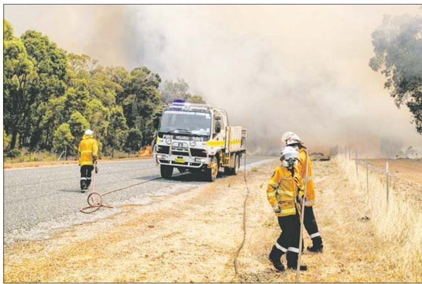
တောမီးလောင်မှုကို ဖြိုဖျက်ပေးရန် ဖိသတ်သမားများကို တွေ့ရစဉ်။

လာသည်။ အချို့သောဒေသမှ ဒေသခံများနှင့် ဟတ်စတာမြို့မှ ဒေသခံများကို ယခုထက်ပို၍ နောက်မကျမီ နေရပ်မှ ထွက်ခွာကြရန် သတိ ပေးထားသည်။