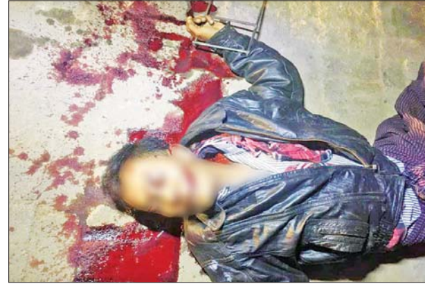
၂၀၂၂ ခုနှစ် ဇန်နဝါရီ ၁၇ ရက်က ဝမ်းတွင်းမြို့နယ် ကျောက်အိုး ကျေးရွာ၌ အပြစ်မဲ့ပြည်သူတစ်ဦး သေနတ်ဖြင့် ပစ်ခတ်သတ်ဖြတ် ခံရသည့် မှတ်တမ်းဓာတ်ပုံ။