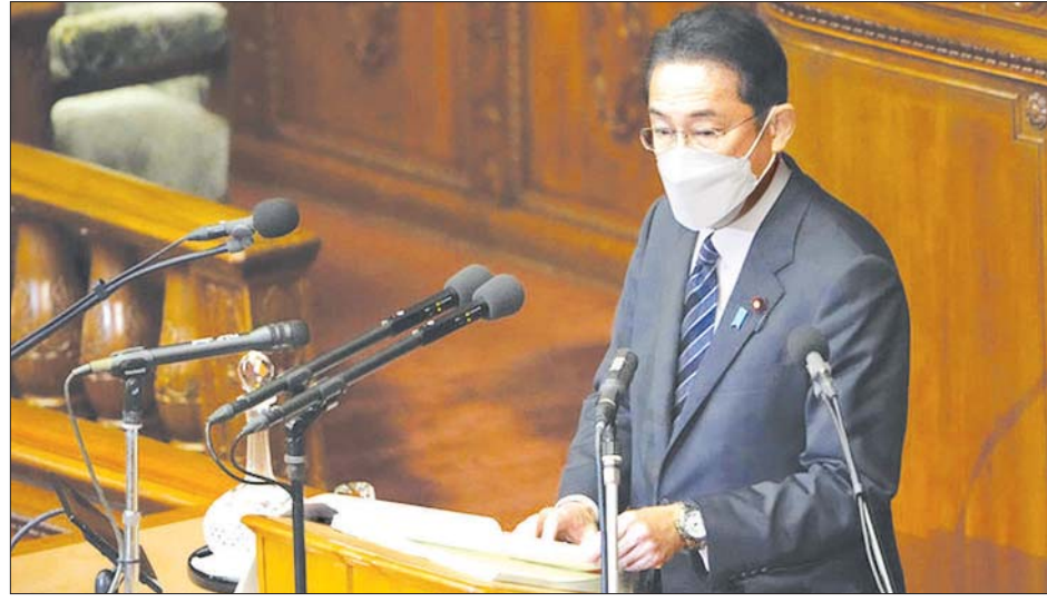
ဂျပန်ဝန်ကြီးချုပ် ဖူမိယိုကီရီးဒါး။

လူမှုရေးလုပ်ဆောင်မှုများကို ဆက်လက်ထိန်းသိမ်းသွားနိုင်ရန် အတွက်လည်း မီးသတ်သမားများ နှင့်ရဲများကို တတိယအကြိမ် ကာကွယ်ဆေး ထိုးကြရန် တိုက် တွန်းသွားမည်ဟု သိရသည်။ အင်န်အိတ်ချ်ကေ