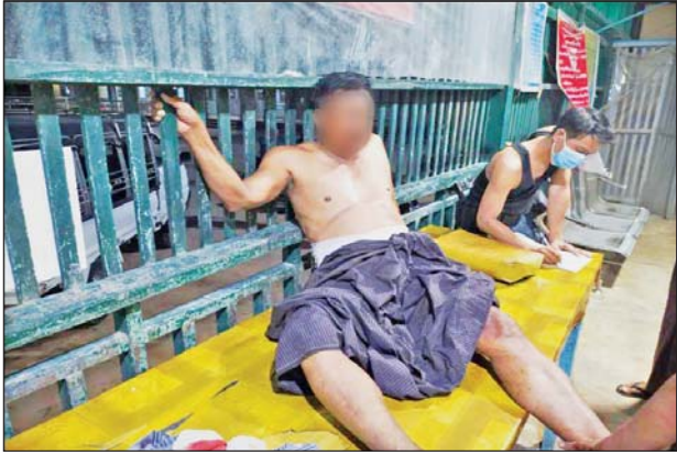
၂၀၂၁ ခုနှစ် အောက်တိုဘာ ၂၇ ရက်က ဝမ်းတွင်းမြို့နယ် နဘဲကန် ကျေးရွာနေ အပြစ်မဲ့ပြည်သူတစ်ဦး သေနတ်ဖြင့် ပစ်ခတ်ခံရသည့် မှတ်တမ်းဓာတ်ပုံ။

သတ်ဖြတ်မှု ၁၇ ကြိမ် ကျူးလွန်ခဲ့ ကြောင်း ဖော်ထုတ်သိရှိရသည်။ ပြည်သူတစ်ရပ်လုံး ပူးပေါင်းပါဝင် သို့ဖြစ်ပါ၍ ဖမ်းဆီးရမိတရားခံများ အား ဥပဒေအရထိရောက်စွာ အရေးယူ နိုင်ရေး ဆက်လက်ဆောင်ရွက်သွားမည် ဖြစ်ပြီး အကြမ်းဖက်မှု ဆောင်ရွက်နေသူ များအား ပြည်သူတစ်ရပ်လုံးက ဝိုင်းဝန်း ကာကွယ်တိုက်ဖျက်ကြရန်နှင့် ပြစ်မှု ကျူးလွန်ရာတွင် ပါဝင်ပတ်သက်သူများ၊ နောက်ကွယ်မှထောက်ပံ့ပေးလျက်ရှိသော ဆက်စပ်တရားခံများအား အမြန်ဆုံး ဖမ်းဆီးရမိရေးအတွက် ၎င်းတို့ပုန်းခိုရာ နေရာများ၊ လှုပ်ရှားသွားလာနေထိုင်မှု သတင်းများရရှိပါက သက်ဆိုင်ရာသို့ လျှို့ဝှက်စွာသတင်းပေး တိုင်ကြားနိုင်ပါ ကြောင်း၊ သတင်းပေးသူနှင့် ဖမ်းဆီးပေး သူများအား ထိုက်တန်စွာ လျှို့ဝှက်၍ ဆုငွေများ ချီးမြှင့်ပေးမည်ဖြစ်ကြောင်း နှင့် မြို့ရွာများ အမြန်ဆုံးအေးချမ်း တည်ငြိမ်ရေးအတွက် ပြည်သူတစ်ရပ်လုံး ပူးပေါင်းပါဝင် ကြိုးပမ်းဆောင်ရွက်နိုင်ပါ ရန် သက်ဆိုင်ရာက အသိပေး သတင်း ထုတ်ပြန်ထားသည်။ သတင်းစဉ်