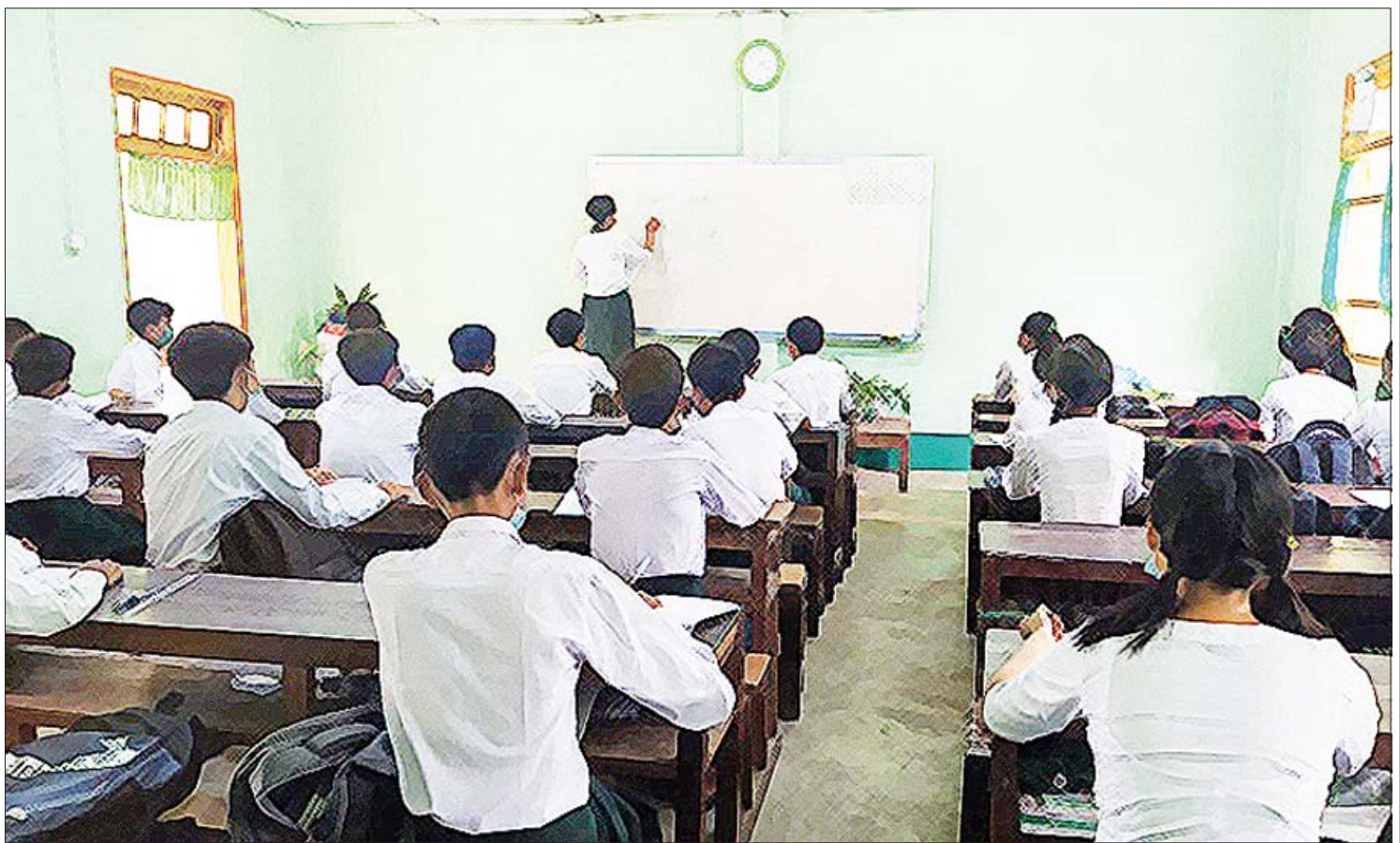
စိတ်ဓာတ်၊ စည်းကမ်း၊ ပညာ ဟူသော ဆောင်ပုဒ်နှင့်အညီ လောကနီတိကျင့်ဝတ်များ စတင်သင်ကြားပေးရာ ကျောင်းတော်မဟာတွင် ပညာသင်ကြားနေကြသည့် ကျောင်းသားကျောင်းသူများ။

ပါတီစုံဒီမိုကရေစီ နိုင်ငံတစ်နိုင်ငံ တွင် ပြည်သူ့ဆန္ဒကို အကောင်အထည် ဖော်မည့် ကိုယ်စားလှယ်များသည် အထွေထွေရွေးကောက်ပွဲများမှ တစ်ဆင့် ယှဉ်ပြိုင်အရွေးခံပြီး လွှတ်တော်ကိုယ်စား လှယ်များ ဖြစ်ကြရသည်။ ထိုအခါ ပြည်သူ့ဆန္ဒအမှန် ဖြစ်စေမည့် ရွေးကောက်ပွဲများအတွက် လွတ်လပ်ပြီး သန့်ရှင်းတရားမျှတရန် လိုအပ်ချက်သည်