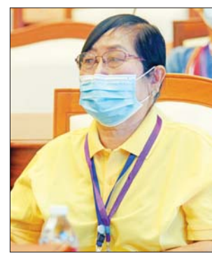
ဒေါ်ဆာဆု

ရှိခဲ့တဲ့ ညီနောင်တစ်စု တည် ထောင်ပြုတဲ့ ပြည်ထောင်စုဆိုတဲ့ အနုစာသရကို အခုလို တိုင်းရင်း သား ဆွေမျိုးပေါင်းစုံ လာတွေ့ဆုံ ရတဲ့အခါမှာ ပိုပြီးတော့ လက်တွေ့ ကျကျခံစားရပါတယ်။ အဲဒီအနုစာ သာရကြောင့် ကိုယ်တိုင်လည်း ဝမ်းမြောက် ဂုဏ်ယူမိပါတယ်။ ဘာကြောင့်လဲဆိုတော့ မမြင်ဖူး တဲ့ ကချင်က တိုင်းရင်းသား တွေနဲ့ တွေ့ရတယ်။ မမြင်ဖူးတဲ့ ကရင်တွေနဲ့လည်း တွေ့ရတယ်။ ပြီးတော့ အချင်းချင်း တစ်ယောက် နဲ့တစ်ယောက် ညီအစ်ကို မောင်နှမလို ဆက်ဆံကြတာဆို တော့ ပိုပြီးတော့ အနုစာသရရှိရုံနဲ့ ပျော်စရာ ကောင်းပါတယ်။ အခုကျွန်တော်တို့ တက် ရောက်လာတဲ့ အချိန်အခါဟာ စိန်ရတုပြည်ထောင်စုကြီးလည်း ဖြစ်ပါ တယ်။ စိန်ရတုပြည်ထောင်စုကြီး မှာ ပါဝင်ရတဲ့အတွက်ကြောင့်မို့