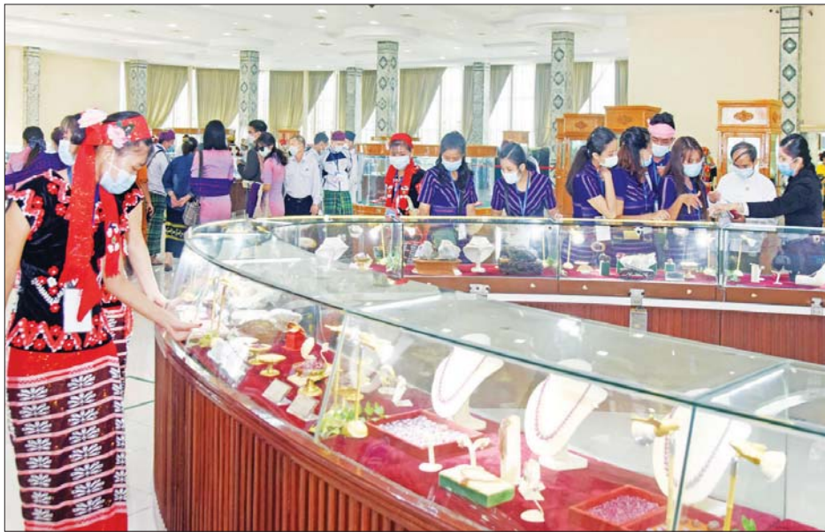
တိုင်းဒေသကြီးနှင့် ပြည်နယ်များမှ တိုင်းရင်းသားရိုးရာ ယဉ်ကျေးမှုအဖွဲ့များ ကျောက်မျက်ရတနာ ပြတိုက်၌ လေ့လာကြသည်။

နေပြည်တော်၌ ကျင်းပမည့် (၇၅) နှစ်မြောက် စိန်ရတုပြည်ထောင်စုနေ့ ဂုဏ်ပြုဖျော်ဖြေပွဲတွင် ရိုးရာ ယဉ်ကျေးမှုအကများဖြင့် ဖျော်ဖြေတင်ဆက်ကြမည့် တိုင်းဒေသကြီးနှင့် ပြည်နယ်များမှ တိုင်းရင်းသားရိုးရာ ယဉ်ကျေးမှုအဖွဲ့များသည် ယနေ့နံနက်ပိုင်းတွင် နေပြည်တော်ရှိ အထင်ကရနေရာများသို့ သွားရောက် လေ့လာကြသည်။