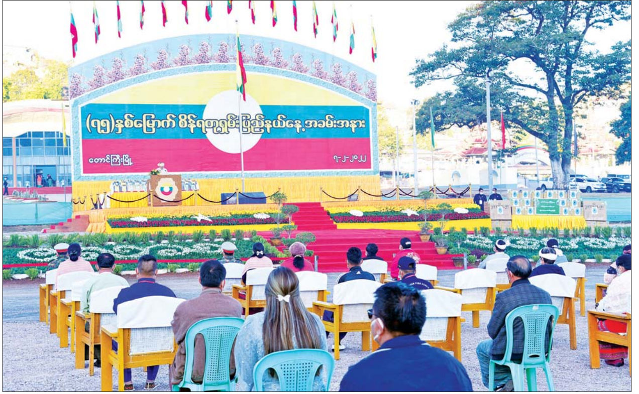
နိုင်ငံတော်စီမံအုပ်ချုပ်ရေးကောင်စီဥက္ကဋ္ဌ နိုင်ငံတော်ဝန်ကြီးချုပ်ဗိုလ်ချုပ်မှူးကြီး မင်းအောင်လှိုင်ထံမှ (၇၅)နှစ်မြောက် စိန်ရတုရမ်းပြည်နယ်နေ့ အခမ်းအနားသို့ ပေးပို့သည့်သဝဏ်လွှာကို နိုင်ငံတော်စီမံအုပ်ချုပ်ရေးကောင်စီအဖွဲ့ဝင် ဦးစိုင်းလုံးဆိုင် ဖတ်ကြားစဉ်။

ယင်းနောက် ဂုဏ်ထူးဆောင်လက်မှတ်နှင့် ဆုပစ္စည်းများချီးမြှင့်ရာ စီမံခန့်ခွဲရေးဆိုင်ရာ ထူးချွန်ဆု ပထမအဆင့် သုံးဆုနှင့် တတိယအဆင့် ခြောက်ဆု၊ လုံခြုံရေးနှင့် တရားဥပဒေစိုးမိုးရေးဆိုင်ရာထူးချွန်ဆု ပထမအဆင့် ၄၄ ဆုနှင့် ဒုတိယအဆင့် တစ်ဆု၊ တတိယအဆင့် ၂၁ ဆု၊ စိုက်ပျိုးရေးထူးချွန်ဆု တတိယအဆင့် နှစ်ဆု၊ မွေးမြူရေးဆိုင်ရာထူးချွန်ဆု တတိယအဆင့် တစ်ဆု၊ ကျန်းမာရေးဆိုင်ရာ ထူးချွန်ဆု တတိယအဆင့် သုံးဆု၊ လူမှုရေးဆိုင်ရာထူးချွန်ဆု(ပထမအဆင့်)တစ်ဆုနှင့် တတိယအဆင့် ၂၇ ဆု၊ သုတေသနဆိုင်ရာ ထူးချွန်ဆု တတိယအဆင့်ဆု တစ်ဆု ရရှိသူများကို နိုင်ငံတော်စီမံအုပ်ချုပ်ရေးကောင်စီအဖွဲ့ဝင် ဦးစိုင်းလုံးဆိုင်၊ Jeng Phang နော်တောင်၊ စောဒန်နီယယ်၊ ဦးရွှေကြိမ်း၊ ပြည်ထောင်စုဝန်ကြီးများ၊ ပြည်နယ်ဝန်ကြီးချုပ် ဒေါက်တာကျော်ထွန်း၊ ပြည်နယ်တရားလွှတ်တော် တရားသူကြီးချုပ်၊ ပြည်နယ်ဝန်ကြီးများ၊ ပြည်နယ် ဥပဒေချုပ်၊ အရှေ့ပိုင်းတိုင်းစစ်ဌာနချုပ် ဒုတိယတိုင်းမှူးတို့က ဂုဏ်ထူးဆောင်လက်မှတ်နှင့် ဆုပစ္စည်းများ ပေးအပ်ချီးမြှင့်