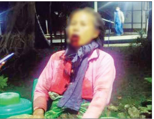
၂၀၂၁ ခုနှစ် ဒီဇင်ဘာ ၁၇ ရက်က ဝမ်းတွင်း မြို့နယ် သဲတောလေး ကျေးရွာ၌ အပြစ်မဲ့ ပြည်သူတစ်ဦး သေနတ် ဖြင့် ပစ်ခတ်ခံရသည့် မှတ်တမ်းဓာတ်ပုံ။