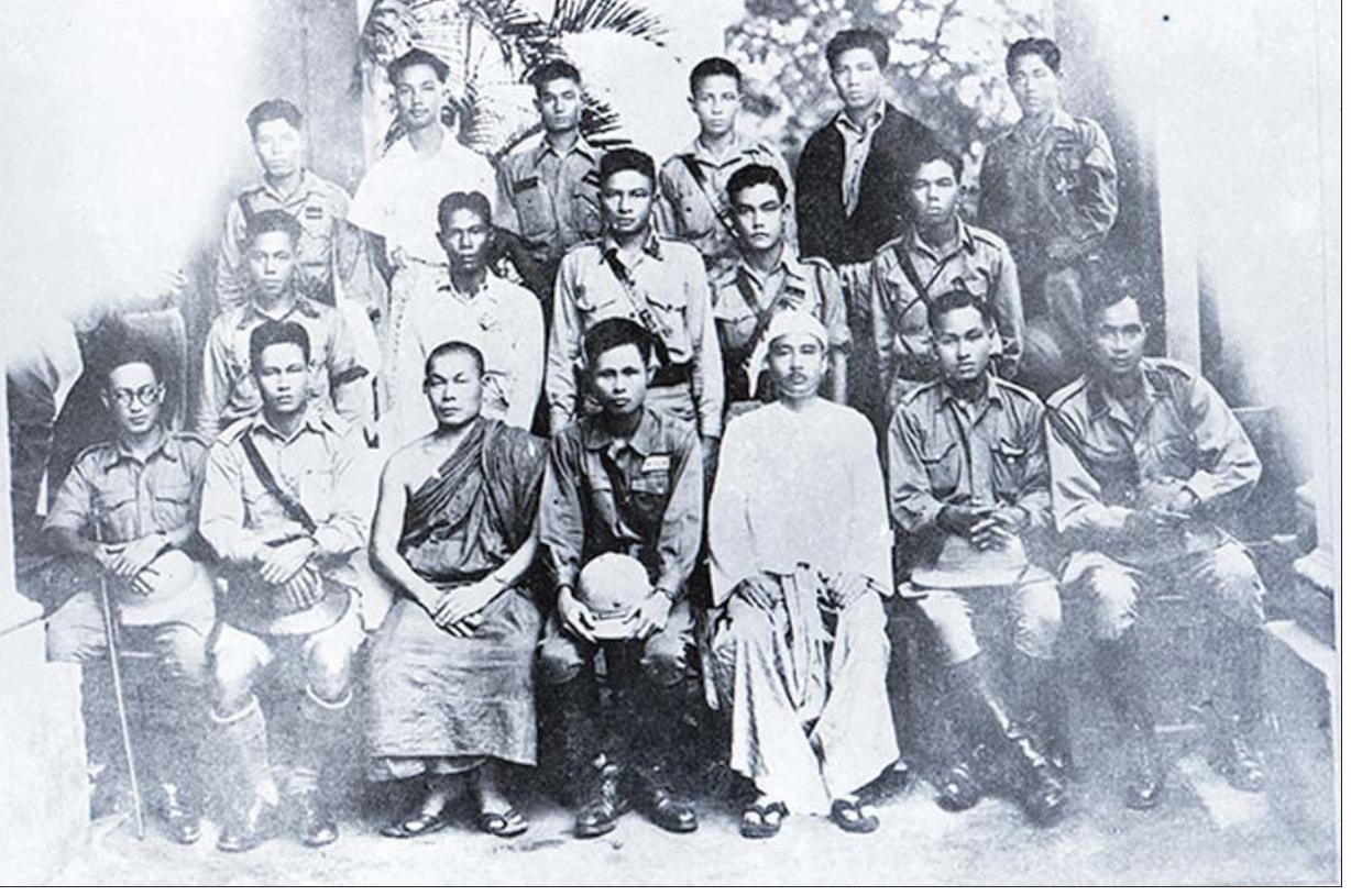
မြန်မာ့လွတ်လပ်ရေးအတွက် တိုက်ပွဲဝင်ခဲ့သည့် ရဲဘော်သုံးကျိပ်အဖွဲ့ဝင်များကို တွေ့ရစဉ်။

ဟူ၍ အိန္ဒိယဘုရင်ခံ ဒတ်ဖရင်က လက်မှတ်ရေးထိုးထုတ်ပြန်လိုက် သည့် ကြေညာစာဟာ ၁၈၈၆ ခုနှစ် ဇန်နဝါရီလ ၁ ရက်နေ့တွင် ရန်ကုန်မြို့၌ လည်းကောင်း၊ ဇန်နဝါရီလ ၄ ရက် နေ့တွင် မန္တလေးမြို့၌ လည်းကောင်း နှစ်နေရာထုတ်ပြန်လိုက်ပြီးသည့်နောက် မြန်မာနိုင်ငံ