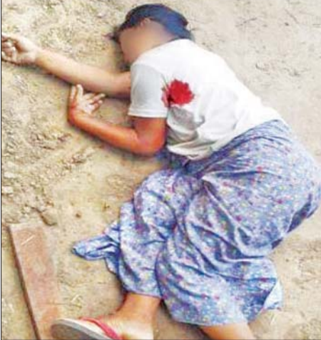
၂၀၂၁ ခုနှစ် နိုဝင်ဘာ ၁၁ ရက် က ဝမ်းတွင်းမြို့နယ် ကျင်းရွာ ကျေးရွာ၌ အမက (ကျင်းရွာ) မှ ကျောင်းဆရာမ တစ်ဦးနှင့် အပြစ်မဲ့ပြည်သူ တစ်ဦးအား သေနတ်ဖြင့် ပစ်ခတ်သတ်ဖြတ် ခံရသည့် မှတ်တမ်းဓာတ်ပုံ။