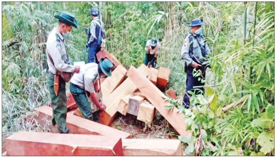
သို့ပါ၍ ဖေဖော်ဝါရီ ၇ ရက်တွင် ဖမ်းဆီးရမိမှု ကုန်သွယ်မှုတိုက်ဖျက်ရေး ဦးဆောင်ကော်မတီမှ စုစုပေါင်းမှာ အမှုတွဲ လေးမှု (ခန့်မှန်းတန်ဖိုး သိရသည်။ ငွေကျပ် ၁၀၇၄၂၀၃၄၀) ဖြစ်ကြောင်း တရားမဝင် သတင်းစဉ်

ကုန်သွယ်မှု တိုက်ဖျက်ရေး အထူးအဖွဲ့၏ စီမံခန့်ခွဲမှု ဖြင့် တိုင်းဒေသကြီး သစ်တောဦးစီးဌာနက ဦးဆောင်၍ ပူးပေါင်းစစ်ဆေးရေး အဖွဲ့များဖြင့် စစ်ဆေးမှုများ ဆောင်ရွက်ခဲ့ရာ ရွှေဘိုခရိုင်အတွင်း တရားမဝင် ကျွန်းတံခါးရွက်၊ ကျွန်းခွဲသားများ ဆိုင်စုံ ၃ ဒသမ ၆၅၆၈ တန် (ခန့်မှန်းတန်ဖိုးငွေကျပ် ၁၀၉၇၀၄၀) ကို ဖမ်းဆီးရမိခဲ့ပြီး သစ်တောဥပဒေနှင့် အညီ အရေးယူ ဆောင်ရွက်လျက်ရှိသည်။ အလားတူ ပဲခူးတိုင်းဒေသကြီး တရားမဝင် ကုန်သွယ်မှု တိုက်ဖျက်ရေး အထူးအဖွဲ့၏ စီမံခန့်ခွဲမှု ဖြင့် တိုင်းဒေသကြီး သစ်တောဦးစီးဌာနက ဦးဆောင် ၍ ပူးပေါင်းစစ်ဆေးရေးအဖွဲ့များဖြင့် စစ်ဆေးမှုများ ဆောင်ရွက်ခဲ့ရာ ပဲခူးနှင့် တောင်ငူခရိုင်များအတွင်း တရားမဝင်သစ်မျိုးစုံ ၁၃ ဒသမ ၇၉၄၄ တန် (ခန့်မှန်းတန်ဖိုးငွေကျပ် ၃,၃၂၃,၃၀၀) ကို ဖမ်းဆီးရမိ ခဲ့ပြီး (ယာပုံ) သစ်တောဥပဒေနှင့်အညီ အရေးယူ ဆောင်ရွက်လျက်ရှိသည်။