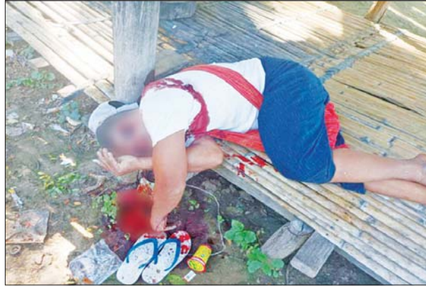
၂၀၂၁ ခုနှစ် နိုဝင်ဘာ ၁၂ ရက်က ဝမ်းတွင်းမြို့နယ် ညဏ်ကန် ကျေးရွာအနီးရှိ ကြေးဝါကြီးဘုရားဈေး၌ အပြစ်မဲ့ပြည်သူတစ်ဦး သေနတ်ဖြင့် ပစ်ခတ်သတ်ဖြတ်ခံရသည့် မှတ်တမ်းဓာတ်ပုံ။