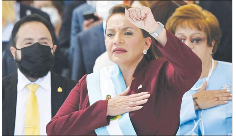
ဟွန်ဒူးရပ်စ်သမ္မတ စီယိုမာရာ ကက်စထရို။