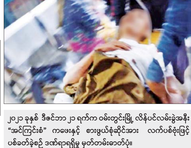
၂၀၂၁ ခုနှစ် ဒီဇင်ဘာ ၂၁ ရက်က ဝမ်းတွင်းမြို့ လိန်ပင်လမ်းခွဲအနီး “အင်ကြင်းစံ” ကဖေးနှင့် စားဖွယ်စုံဆိုင်အား လက်ပစ်မိုးဖြင့် ပစ်ခတ်ခဲ့စဉ် ဒဏ်ရာရရှိမှု မှတ်တမ်းဓာတ်ပုံ။