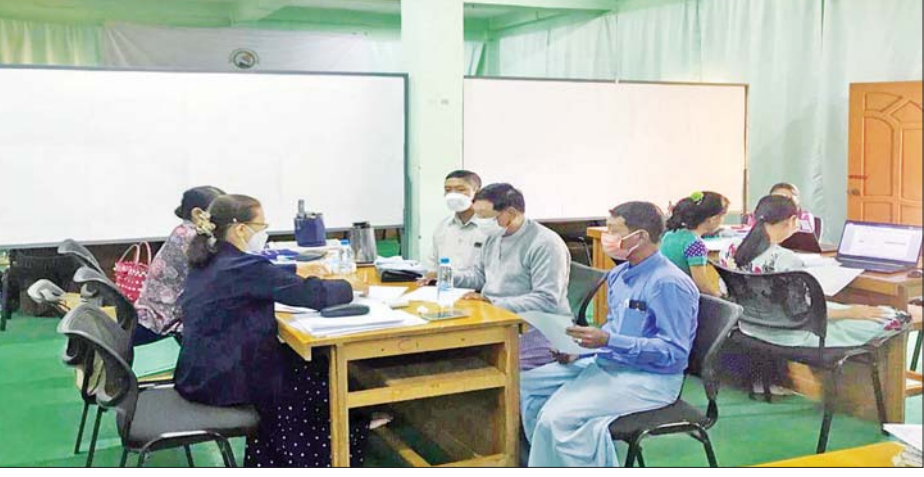
ပြည်သူ့အင်အားပါတီအား စစ်ဆေးရေးအဖွဲ့က စစ်ဆေးစဉ်။

စုဆောင်းခြင်း၊ ထိန်းသိမ်းခြင်း၊ သုံးစွဲခြင်း၊ စစ်ဆေးခြင်းနှင့် စာရင်းရှင်းလင်း ဖျက်သိမ်းခြင်း၊ ပါတီဆိုင်ရာလုပ်ငန်းများကို စနစ်တကျ ဆောင်ရွက်ထားခြင်း ရှိမရှိတို့ကို စစ်ဆေးလျက်ရှိသည်။