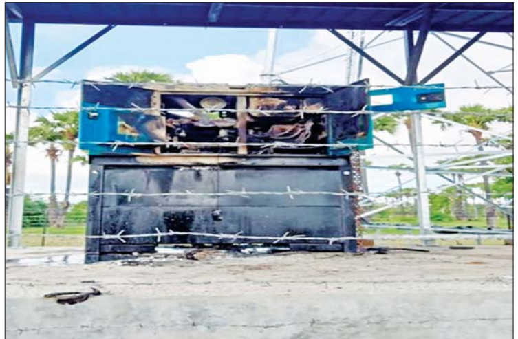
၂၀၂၁ ခုနှစ် အောက်တိုဘာ ၇ ရက်က ဝမ်းတွင်းမြို့နယ် ဖလန်ကျင်းကျေးရွာရှိ Mytel ဆက်သွယ်ရေးတာဝါတိုင် မီးရှို့ဖျက်ဆီးခံရသည့် မှတ်တမ်းဓာတ်ပုံ။