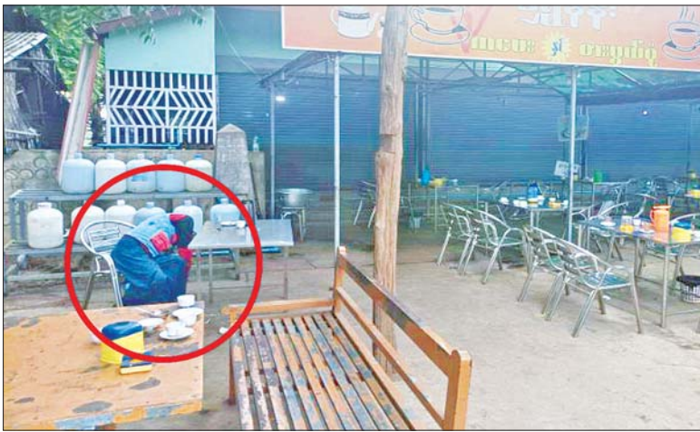
၂၀၂၁ ခုနှစ် နိုဝင်ဘာ ၁၄ ရက်က ဝမ်းတွင်း မြို့နယ် ဝမ်းတွင်း (၃) ရပ်ကွက်တွင် အပြစ်မဲ့ ပြည်သူ တစ်ဦး သေနတ်ဖြင့် ပစ်ခတ် သတ်ဖြတ် ခံရသည့် မှတ်တမ်း ဓာတ်ပုံ။