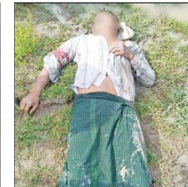
၂၀၂၁ ခုနှစ် အောက်တိုဘာ ၂၆ ရက် တွင် ဝမ်းတွင်းမြို့နယ် ခင်ကြီးကျေးရွာ တွင် အပြစ်မဲ့ပြည်သူ တစ်ဦး သေနတ် ဖြင့် ပစ်ခတ်သတ်ဖြတ်ခံရသည့် မှတ်တမ်းဓာတ်ပုံ။