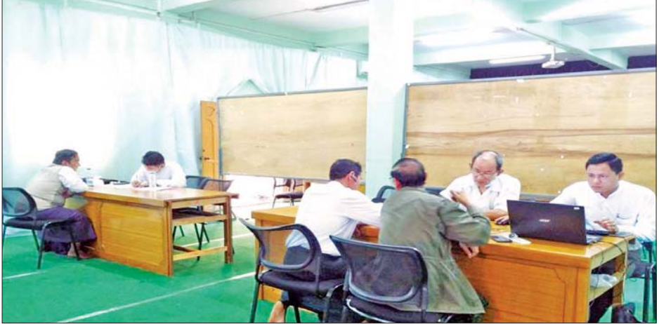
ပြည်သူ့အကျိုးပြု ကျောင်းသားများပါတီအား စစ်ဆေးရေးအဖွဲ့က စစ်ဆေးစဉ်။

ထိုသို့ ဆောင်ရွက်ရာတွင် ပြည်ထောင်စု ရွေးကောက်ပွဲကော်မရှင်အဖွဲ့ဝင်များဖြစ်သည့် ဦးစောလှိုင်နှင့် ဦးဘရန်ရှောင် တို့ဦးဆောင်ပြီး စာရင်းစစ်ချုပ်ရုံး၊ ပြည်တွင်းအခွန်များဦးစီးဌာနနှင့် အထူးစုံစမ်းစစ်ဆေးရေးဦးစီးဌာန တို့မှ ဌာနဆိုင်ရာကိုယ်စားလှယ်များ ပါဝင်သည့် စစ်ဆေးရေးအဖွဲ့သည် ရန်ကုန်မြို့အခြေစိုက်ဖြစ်သော ပြည်သူ့အကျိုးပြု ကျောင်းသားများပါတီ၊ ခေတ်သစ် ပြည်ထောင်စုပါတီ၊ လူထုပါတီ ( The Party for People ) နှင့် ပြည်သူ့အင်အား ပါတီတို့ကို ဇန်နဝါရီ ၃၁ ရက်မှ ဖေဖော်ဝါရီ ၄ ရက်အထိ စစ်ဆေးဆောင်ရွက်ခဲ့ကြောင်း သိရသည်။ သတင်းစဉ်