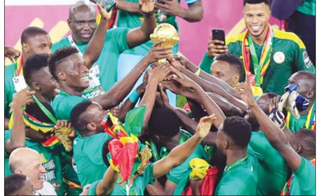
အာဖရိကနိုင်ငံများဖလားဆွတ်ခူးပြီးနောက် ဆီနီဂေါအသင်းသားများ အောင်ပွဲခံနေစဉ်။

အာဖရိကနိုင်ငံများဖလားပြိုင်ပွဲ ဗိုလ်လုပွဲစဉ်အဖြစ် ဆီနီဂေါအသင်းနှင့် အီဂျစ်အသင်းတို့ပွဲစဉ်ကို ဖေဖော်ဝါရီ ၇ ရက် နံနက်ပိုင်းက ယှဉ်ပြိုင်ကစားခဲ့ရာ ဆီနီဂေါအသင်းက ပယ်နယ်တီတွင် လေးဂိုး-နှစ်ဂိုးဖြင့် အနိုင်ရရှိပြီး အသင်းသမိုင်းတစ်လျှောက် ပထမဆုံးအကြိမ် ဆွတ်ခူးနိုင်ခဲ့သည်။ ဆီနီဂေါအသင်းသည် ၂၀၀၂ ခုနှစ်နှင့် ၂၀၁၉ ခုနှစ်တို့တွင် စာမျက်နှာ ၂၄ ကော်လံ ၁ ●