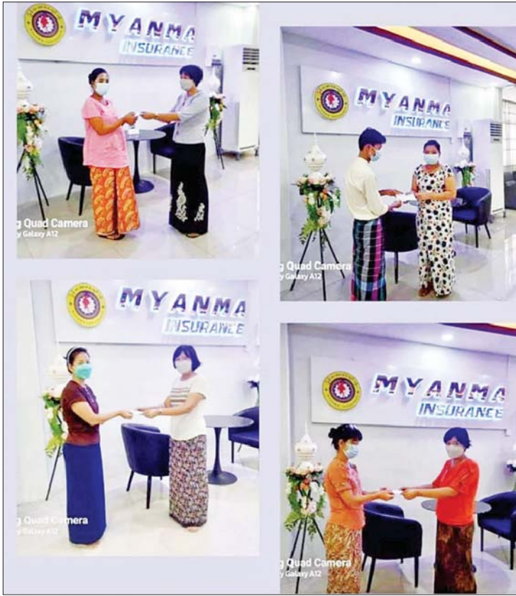
သူတစ်ပါးထိခိုက်မှုအာမခံနစ်နာကြေးအား ပြည်သူများသို့ ထုတ်ပေးနေပုံ။

မြန်မာ့အာမခံလုပ်ငန်းမှ ဝန်ဆောင်မှု ပေးနေသည့် သူတစ်ပါးထိခိုက်မှုအာမခံ အကြောင်းကို မသိသေးသော ပြည်သူများ ရှိနေပါသည်။ သူတစ်ပါး ထိခိုက်မှု အာမခံပရီမီယံပေးသွင်းမှု မှတ်တမ်း စာအုပ်ဖြစ်သော စာအုပ်အစိမ်းကို ကုန်းလမ်းပို့ဆောင်ရေးညွှန်ကြားမှုဦးစီးဌာန၏ ယာဉ်လိုဏ်ခတ်သက်တမ်းတိုးချိန်တွင် လိုအပ်သည့် မော်တော်ယာဉ် ပရီမီယံစာအုပ်ဟုသာ အလွယ်တကူ သိထားကြသည်။ မည်သည့်အတွက်ကြောင့် ပရီမီယံဆောင်ရသည်၊ ပရီမီယံပေးဆောင်ခြင်းမှ မည်သည့်အကျိုးကျေးဇူးရှိစေသည် စသည်တို့ကို သိရှိသူနည်းပါးလျက်ရှိပါသည်။ ပြည်သူတို့ ထိခိုက်နစ်နာမှုအတွက် ရရှိသည့် အခွင့်အရေးများ မသိကြသည့်အတွက် နစ်နာမှုများရှိသည့်အပြင် အချို့သော ယာဉ်ပိုင်ရှင်များသည်လည်း ပရီမီယံပေးရခြင်းကို အကျိုးမရှိ အလဟဿ ကောက်ခံနေသည့် လုပ်ငန်းဟု ထင်မြင်သူများလည်း ရှိပါသည်။ သူတစ်ပါးထိခိုက်မှုအာမခံဆိုသည်မှာ မိမိ၏စက်တပ်ယာဉ်ကြောင့် သူတစ်ပါးသေဆုံးမှုနှင့် ထိခိုက်ဒဏ်ရာ ရခဲ့လျှင် နစ်နာကြေးငွေ ပေးချေနိုင်မည့် အာမခံအမျိုးအစားတစ်မျိုးဖြစ်ပါသည်။