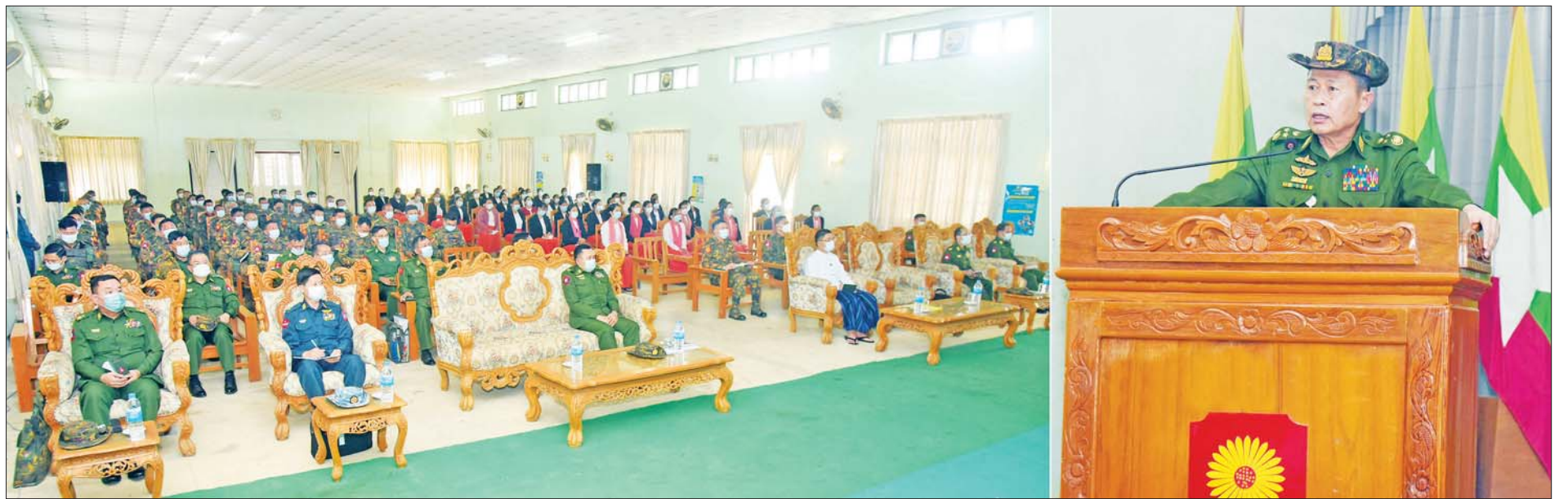
နိုင်ငံတော်စီမံအုပ်ချုပ်ရေးကောင်စီ ဒုတိယဥက္ကဋ္ဌ ဒုတိယတပ်မတော်ကာကွယ်ရေးဦးစီးချုပ် ကာကွယ်ရေးဦးစီးချုပ် (ကြည်း) ဒုတိယဗိုလ်ချုပ်မှူးကြီး စိုးဝင်း လှိုင်ကော်တပ်နယ်မှ အရာရှိ၊ စစ်သည်၊ မိသားစုများအား တွေ့ဆုံအမှာစကား ပြောကြားစဉ်။

အကြမ်းဖက်အဖွဲ့အစည်းများဖြစ်သည့် NUG၊ CRPH နှင့် ၎င်းတို့၏လက်ဝေခံ PDF အမည်ခံအကြမ်းဖက်သမားများ၊ တည်ငြိမ်အေးချမ်းမှုကို မလိုလားသည့် အချို့မီဒီယာမှ လူမှုကွန်ရက်စာမျက်နှာများပေါ်တွင် မဟုတ်မမှန် ကောလာဟလသတင်းများကို ရေးသားဖြန့်ချိလျက်ရှိ