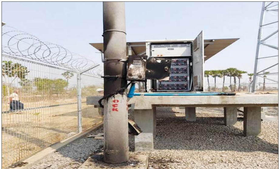
အယူအဆမတူ၊ ရပ်တည်ချက်မတူတိုင်း ဒီမိုကရေစီမဟုတ်ဟု သတ်မှတ်နေကြသည့် အကြမ်းဖက် သမားများက ပြည်သူများ၏ လူမှုဆက်သွယ်ရေး၌ အရေးပါသည့် ဆက်သွယ်ရေးတာဝါတိုင်များကိုပင် အလွတ်မပေး ဖျက်ဆီးမှုများဆောင်ရွက်ရာ ကနီမြို့နယ်တွင် မီးရှို့ဖျက်ဆီးခံရသည့် ဆက်သွယ်ရေး တာဝါတိုင်။

မိမိတို့မြန်မာနိုင်ငံသူ နိုင်ငံသားများအားလုံး မျှော်လင့်တောင့်တနေသည်ကား စည်းကမ်းပြည့်ဝ သော ဒီမိုကရေစီနှင့် ဖက်ဒရယ်စနစ်ကိုအခြေခံသည့် ပြည်ထောင်စုကြီးကို တည်ဆောက်နိုင်ရေးပင် ဖြစ်ပါသည်။ အချို့သောသူများကဲ့သို့ ဒီမိုကရေစီရရှိ ရေး ဒီမိုကရေစီရရှိရေးဟု အော်ဟစ်ကြွေးကြော် နေခြင်း၊ ကန့်လန့်တိုက်ဆန္ဒပြ၊ ချုံခိုတိုက်ခိုက်နေ ခြင်းတို့ဖြင့် အချိန်မကုန်ဆုံးစေလိုပါ။ ဒီမိုကရေစီ၏ အနှစ်သာရ၊ အမှန်တရားကို သိမြင်နားလည်၍ မိမိ တို့နိုင်ငံနှင့် အသင့်တော်ဆုံးဖြစ်မည့် ဒီမိုကရေစီ ပြုပြင်ပြောင်းလဲခြင်းအဆင့်တိုင်းကို ပြည်သူတိုင်းက စည်းကမ်းတကျ၊ စည်းစည်းလုံးလုံး ဖော်ဆောင်ရင်း ဒီမိုကရေစီနိုင်ငံတော်ကြီးကို ပိုင်ဆိုင်ကြရမည့် အချိန်သာ ဖြစ်ပါကြောင်း။ ။