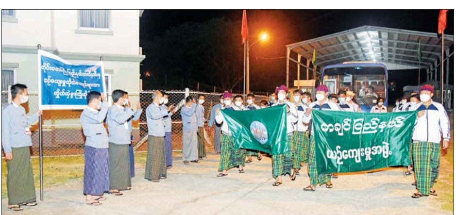
တိုင်းရင်းသားယဉ်ကျေးမှုကိုယ်စားလှယ်အဖွဲ့များ နေပြည်တော်သို့ ရောက်ရှိလာစဉ်။

(၇၅) နှစ်မြောက် စိန်ရတု ပြည်ထောင်စုနေ့ အခမ်းအနား တွင် တိုင်းရင်းသားရိုးရာ ယဉ်ကျေးမှုအကများဖြင့် ဖျော်ဖြေ တင်ဆက်ကြမည့် တိုင်းဒေသကြီး နှင့် ပြည်နယ်များမှ တိုင်းရင်းသား ယဉ်ကျေးမှု ကိုယ်စားလှယ်အဖွဲ့ များသည် ယနေ့ နံနက်ပိုင်းမှ စတင်၍ နေပြည်တော်ကောင်စီ နယ်မြေ ဓမ္မဗိမ္မာန်အား အားကစား လေ့ကျင့်ရေးစခန်းသို့ ရောက်ရှိကြသည်။ ထိုသို့ ရောက်ရှိလာကြသည့် တိုင်းရင်းသား ယဉ်ကျေးမှု ကိုယ်စားလှယ် အဖွဲ့များကို စိန်ရတုပြည်ထောင်စုနေ့ ကြိုဆို နေရာချထားရေး၊ ပို့ဆောင်ရေးနှင့် ဆက်သွယ်ရေး ဆပ်ကော်မတီ၊ ပြန်ကြားရေးဆပ်ကော်မတီတို့မှ