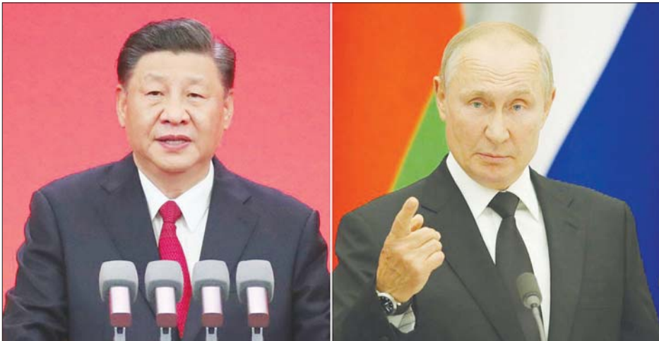
တရုတ်သမ္မတ