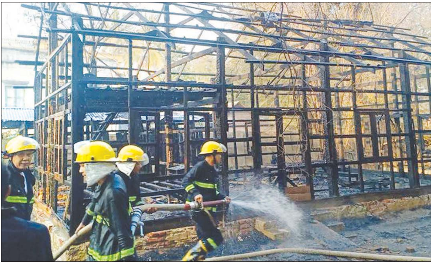
ဒီမိုကရေစီနှင့်ဆန့်ကျင်သည့် အကြမ်းဖက်လုပ်ရပ်များကို လုပ်ဆောင်နေသည့် NUG/PDF အဖွဲ့များက နိုင်ငံတော်၏ ပညာရေးအဆောက်အအုံများကို ယုတ်မာသောအကြံအစည်များဖြင့် ဖျက်ဆီးရာ မြင်းခြံမြို့နယ် အထက(၄)ကျောင်း အဆောက်အအုံတစ်လုံးအား မီးကွင်းပစ်ခတ်မှုကြောင့် မီးလောင် ဆုံးရှုံးပျက်စီးမှု။

စင်စစ် ဒီမိုကရေစီစနစ်သည် လူတစ်ဦး၏ နှုတ်ထွက်စကားနှင့် စိတ်ကူးပေါက်ရာကို အကောင် အထည်ဖော်ရသည့် နိုင်ငံရေးစနစ်မျိုးမဟုတ်သကဲ့ သို့ ဒီမိုကရေစီ ပြုပြင်ပြောင်းလဲမှုတွင် အဆင့်လိုက်၊ အဆင့်လိုက် စည်းလုံးညီညွတ်စွာ ဆောင်ရွက်မှသာ ပြည်သူများ လိုလားတောင့်တသည့် စစ်မှန်၍ စည်းကမ်းပြည့်ဝသော ပါတီစုံဒီမိုကရေစီ စနစ်ကို တရားမျှတမှုအပြည့် ကျင့်သုံးလာနိုင်မည်။ ဒီမို ကရေစီနှင့် ဖက်ဒရယ်စနစ်ကို အခြေခံသည့် ပြည်ထောင်စု စနစ်တကျပေါ်ထွက်လာမည်ဖြစ်