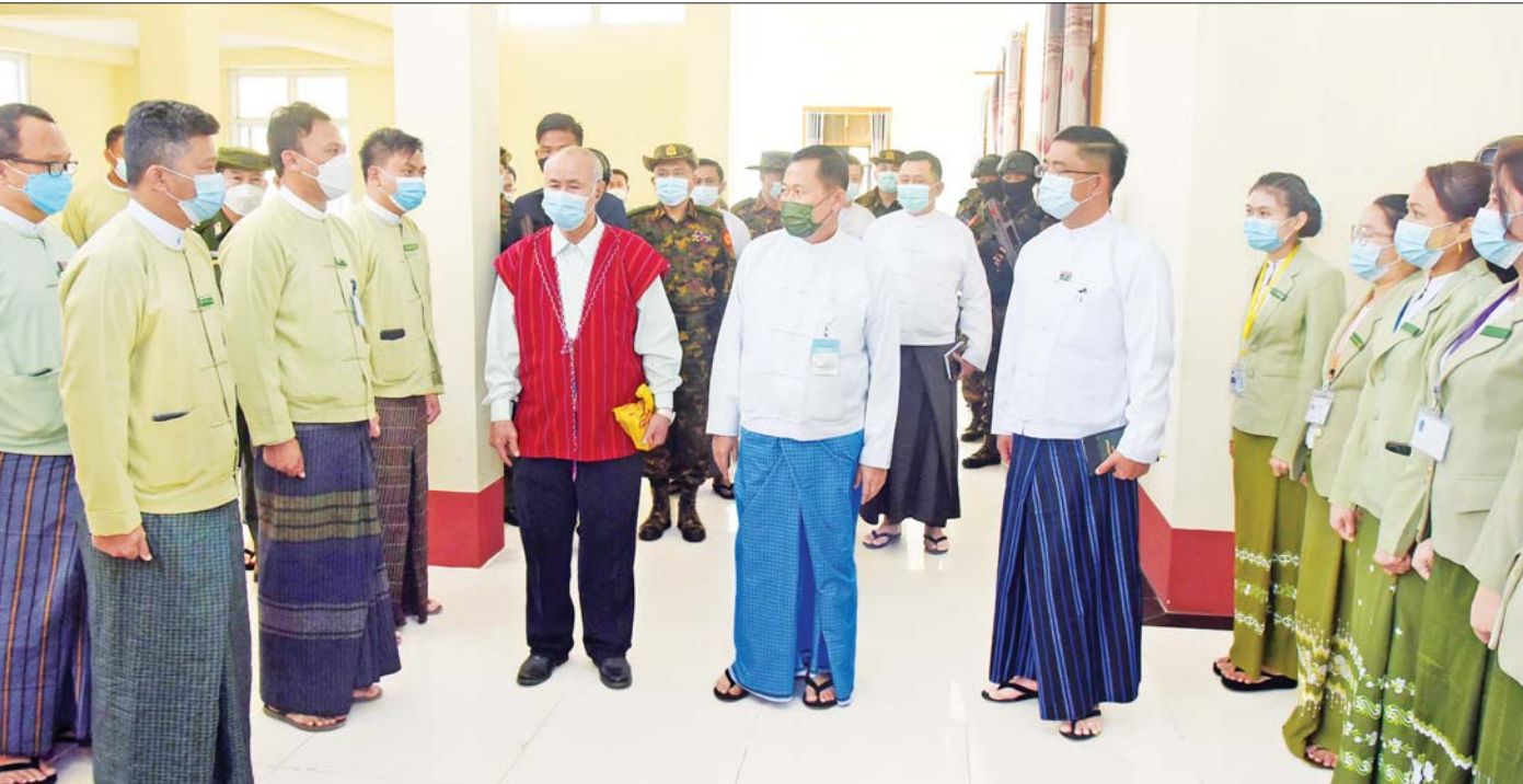
နိုင်ငံတော်စီမံအုပ်ချုပ်ရေးကောင်စီ ဒုတိယဥက္ကဋ္ဌ ဒုတိယတပ်မတော်ကာကွယ်ရေးဦးစီးချုပ် ကာကွယ်ရေးဦးစီးချုပ်(ကြည်း) ဒုတိယဗိုလ်ချုပ်မှူးကြီး စိုးဝင်းဝန်ထမ်းများအား ရင်းရင်းနှီးနှီးနှုတ်ဆက်စဉ်။

ဦးစွာ နိုင်ငံတော်စီမံအုပ်ချုပ်ရေးကောင်စီ ဒုတိယဥက္ကဋ္ဌ ဒုတိယဗိုလ်ချုပ်မှူးကြီး စိုးဝင်းက အဖွင့်အမှာစကား ပြောကြားရာတွင် ကယားပြည်နယ်အတွင်း တည်ငြိမ်အေးချမ်းရေး၊ ပြန်လည်ဖွံ့ဖြိုးရေးနှင့် ထူထောင်ရေးလုပ်ငန်းများဆောင်ရွက်ရာတွင် အကြံကောင်းများဖြင့် ပူးပေါင်းဆောင်ရွက်သွားရန်လိုကြောင်း၊ အချို့သောဝန်ထမ်းများအနေဖြင့် အမျိုးမျိုးသော သွေးတိုးမှု၊ ခြိမ်းခြောက်မှုတို့ကြောင့် CDM ပြုလုပ်ခြင်းနှင့် အကြောင်းအမျိုးမျိုးဖြင့် ပျက်ကွက်မှုများရှိသော်လည်း ယခုကဲ့သို့ သစ္စာရှိစွာဖြင့် တာဝန်ထမ်းဆောင်နေသော နိုင်ငံဝန်ထမ်းကောင်းများကို လေးစားအသိအမှတ်ပြုပါကြောင်း၊ အခက်အခဲအမျိုးမျိုးကြားမှတာဝန်ကိုမည်သည့်အခါမှလျော့စားတတ်ဖွံ့ဖြိုးလိုသော ရည်ရွယ်ချက်ဖြင့် ကြိုးစားနေမှုကိုလည်း ချီးကျူးဂုဏ်ပြုပါကြောင်း၊ အကြမ်းဖက်အဖွဲ့များအနေဖြင့် ၂၀၂၂ ခုနှစ်၊ ဇန်နဝါရီ ၁၄ ရက်တွင် ကယားပြည်နယ်ကို သိမ်းပိုက်မည်ဟူသည့် ကြွေးကြော်မှု၊ ခြိမ်းခြောက်မှုများဖြင့် အကြမ်းဖက်လုပ်ရပ်များ လုပ်ဆောင်လာခဲ့သော်လည်း သစ္စာရှိနိုင်ငံဝန်ထမ်းများနှင့် လုံခြုံရေးတပ်ဖွဲ့များ၏ ပူးပေါင်းဆောင်ရွက်မှု၊ ဒေသခံများ၏ ပူးပေါင်းပါဝင်မှုတို့ဖြင့် တွန်းလှန်နိုင်ခဲ့ပါကြောင်း၊ ကယားပြည်နယ် တည်ငြိမ်အေးချမ်းပြီး တရားဥပဒေစိုးမိုးဖွံ့ဖြိုးတိုးတက်ရေးသည် တစ်ဦးကောင်း၊ တစ်ယောက်ကောင်းဖြင့် ဆောင်ရွက်၍မရဘဲ အားလုံးပါဝင် ပူးပေါင်းညှိနှိုင်းဆောင်ရွက်ကြရန် လိုကြောင်း၊ ရှေ့ဆက်၍လည်း ဖြစ်ပေါ်လာနိုင်သည့် အခက်အခဲများကို ယခုကဲ့သို့ ဌာနဆိုင်ရာများ ညီညွတ်စွာ ပူးပေါင်းဆောင်ရွက်၍ ကျော်ဖြတ်သွားရမည်ဖြစ်ကြောင်း။