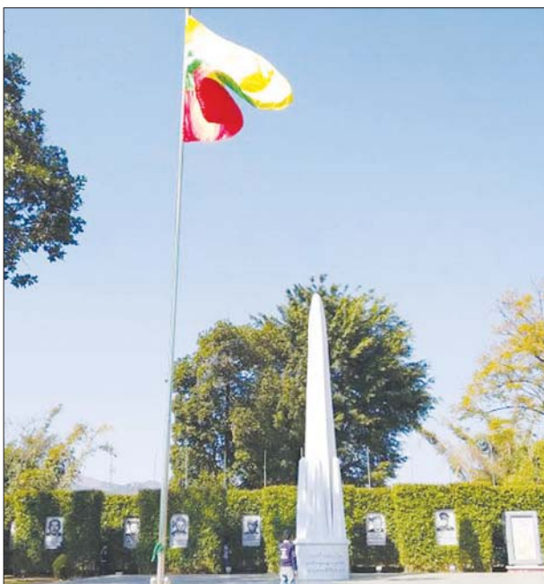
ပင်လုံမြို့ရှိ တောင်တန်း-ပြည်မ ပေါင်းစည်းရေး အထိမ်းအမှတ် ကျောက်တိုင်ကို တွေ့ရစဉ်။

ပြည်ထောင်စုနေ့သည် စိန်ရတုပင်တိုင်ခဲ့ပါပြီ။ လွတ်လပ်ရေးကြိုးပမ်းစဉ်ကာလက သားချင်း မောင်နှမ တိုင်းရင်းသားအားလုံး စည်းလုံးညီညွတ် စွာဖြင့် ကိုလိုနီလက်အောက်ခံဘဝတွင် မနေလိုကြောင်း ကတိသစ္စာပြုပြီး မှတ်တမ်းတင်သည့်နေ့လည်းဖြစ်ပါသည်။ မြန်မာနိုင်ငံ တည်စကတည်းက အေးအတူပူအမျှ ဥပမာသိုက်မပျက် မခွဲခွဲကြသည့် အစဉ်အလာကောင်း အစဉ်အလာမြတ်ကို “ငါတို့ မြန်မာတိုင်းရင်းသား မောင်နှမသားချင်းတွေ ထာဝရထိန်းသိမ်းမည်” ဟု ဆက်လက်နယ်ချဲ့လိုသူတို့ကို ပြဆိုလိုက်ခြင်းပါ။