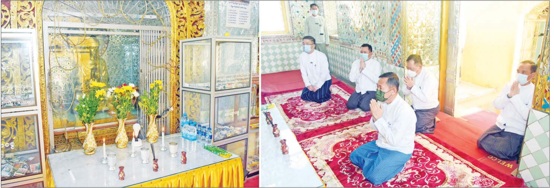
နိုင်ငံတော်စီမံအုပ်ချုပ်ရေးကောင်စီ ဒုတိယဥက္ကဋ္ဌ ဒုတိယတပ်မတော်ကာကွယ်ရေးဦးစီးချုပ် ကာကွယ်ရေးဦးစီးချုပ်(ကြည်း) ဒုတိယဗိုလ်ချုပ်မှူးကြီး စိုးဝင်းနှင့် အဖွဲ့ဝင်များ လှိုင်ကော်မြို့ရှိ မြို့နယ်ရွှေစေတီတော်အား ဖူးမြော်ကြည့်ညှိစဉ်။