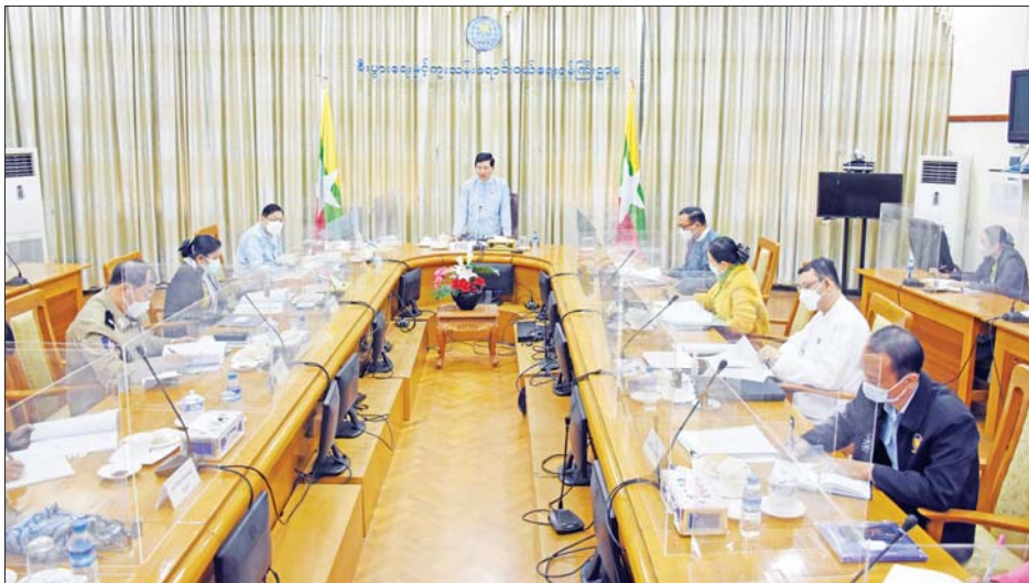
ကော်မရှင်က ဆက်လက်ဆောင် ရွက်မည့် လုပ်ငန်းအစီအစဉ်များ နှင့်စပ်လျဉ်း၍ ကော်မရှင်ရုံး တာဝန်ရှိသူများက ရှင်းလင်းတင်ပြ ဆွေးနွေးခဲ့ပြီး ကော်မရှင်အဖွဲ့ဝင် ဥက္ကဋ္ဌနှင့် ကော်မရှင်အဖွဲ့ဝင်များ၊ ကော်မရှင်ရုံးအဖွဲ့မှ တာဝန်ရှိသူ များ တက်ရောက်ခဲ့ကြကြောင်း သိရသည်။ သတင်းစဉ်

ဆွေးနွေးခဲ့ပြီး ကော်မရှင်အဖွဲ့ဝင် ဥက္ကဋ္ဌနှင့် ကော်မရှင်အဖွဲ့ဝင်များ၊ ကော်မရှင်ရုံးအဖွဲ့မှ တာဝန်ရှိသူ များ တက်ရောက်ခဲ့ကြကြောင်း သိရသည်။ သတင်းစဉ်