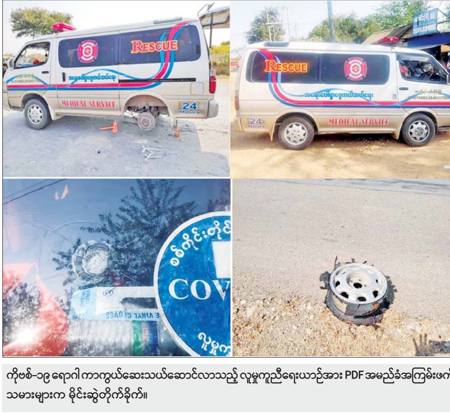
ကိုဗစ်-၁၉ ရောဂါ ကာကွယ်ဆေးသယ်ဆောင်လာသည့် လူမှုကူညီရေးယာဉ်အား PDF အမည်ခံအကြမ်းဖက် သမားများက မိုင်းဆွဲတိုက်ခိုက်။

သော်လည်း HSE/1613 လူမှုကူညီရေးယာဉ်၏ ရှေ့လေကာမှန်ကွဲအက်ကာ ယာဉ်၏ ဝဲဘက် နောက်ဘီး ပွင့်ထွက်ပျက်စီးခဲ့သည်။ ပေါက်ကွဲမှုဖြစ်ပွားသည့်နေရာသို့ လုံခြုံရေး တပ်ဖွဲ့ဝင်များက သွားရောက်စစ်ဆေးပြီး အကြမ်း ဖက်သမားများ၏ မိုင်းဆွဲတိုက်ခိုက်မှုကြောင့် ပျက်စီးခဲ့သည့် ကိုဗစ်-၁၉ ရောဂါ ကာကွယ်ဆေး တင်ဆောင်လာသည့် လူမှုကူညီရေးယာဉ်အား ပြန်လည်ပြင်ဆင်၍ စစ်ကိုင်းမြို့သို့ လိုက်ပါပို့ဆောင် ပေးသည်။ ထိုကဲ့သို့ ပြည်သူများအား ထိုးနှံပေးမည့် ကိုဗစ်-၁၉ ကာကွယ်ဆေးများ သယ်ဆောင်လာသည့် လူမှု ကူညီရေးယာဉ်များအား မိုင်းဆွဲတိုက်ခိုက်ခဲ့သည့် အကြမ်းဖက်သမားများအား ဖော်ထုတ်ဖမ်းဆီးရမိနိုင် ရေး လုံခြုံရေးတပ်ဖွဲ့ဝင်များက နယ်မြေခံတပ်မတော် စစ်ကြောင်းများနှင့် ပူးပေါင်း၍ ဆက်လက်ဆောင်ရွက် လျက်ရှိကြောင်း သတင်းရရှိသည်။ သတင်းစဉ်