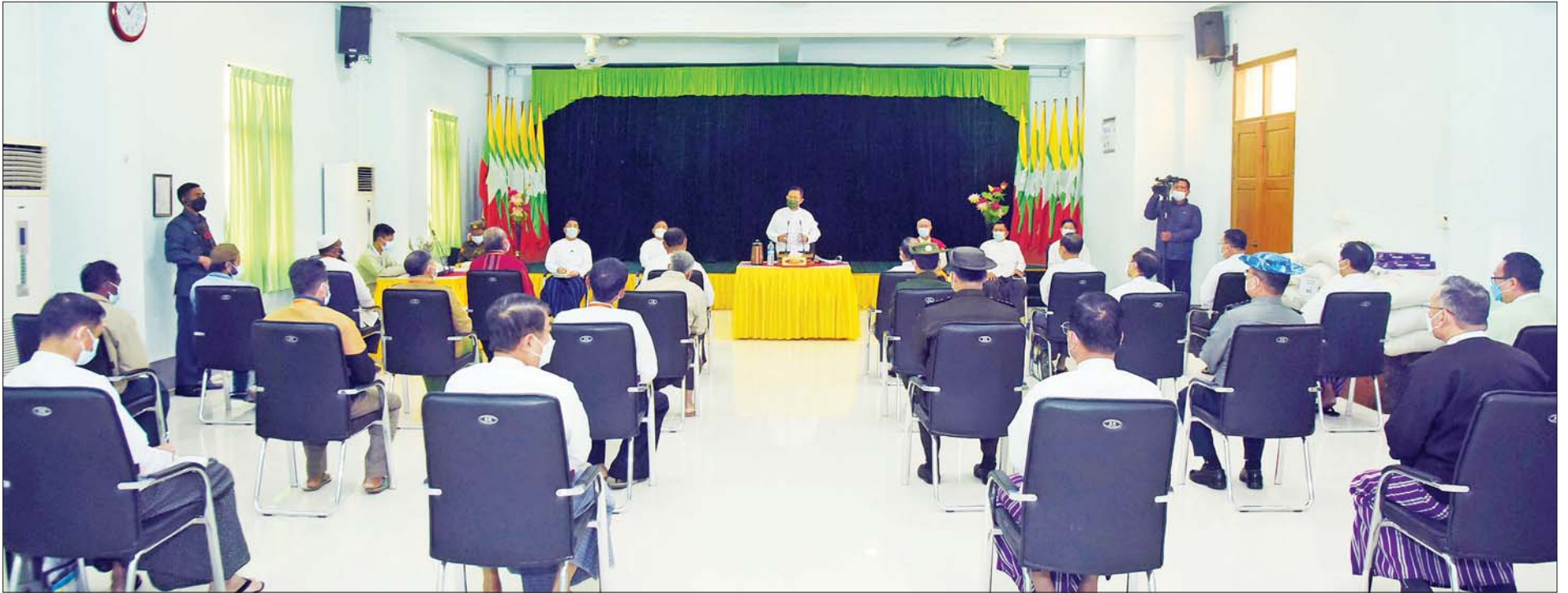
နိုင်ငံတော်စီမံအုပ်ချုပ်ရေးကောင်စီ ဒုတိယဥက္ကဋ္ဌ ဒုတိယတပ်မတော်ကာကွယ်ရေးဦးစီးချုပ် ကာကွယ်ရေးဦးစီးချုပ်(ကြည်း) ဒုတိယဗိုလ်ချုပ်မှူးကြီး စိုးဝင်း လွိုင်ကော်မြို့ရှိ ဘာသာရေးအသင်းအဖွဲ့ခေါင်းဆောင်များအား တွေ့ဆုံအမှာစကားပြောကြားစဉ်။