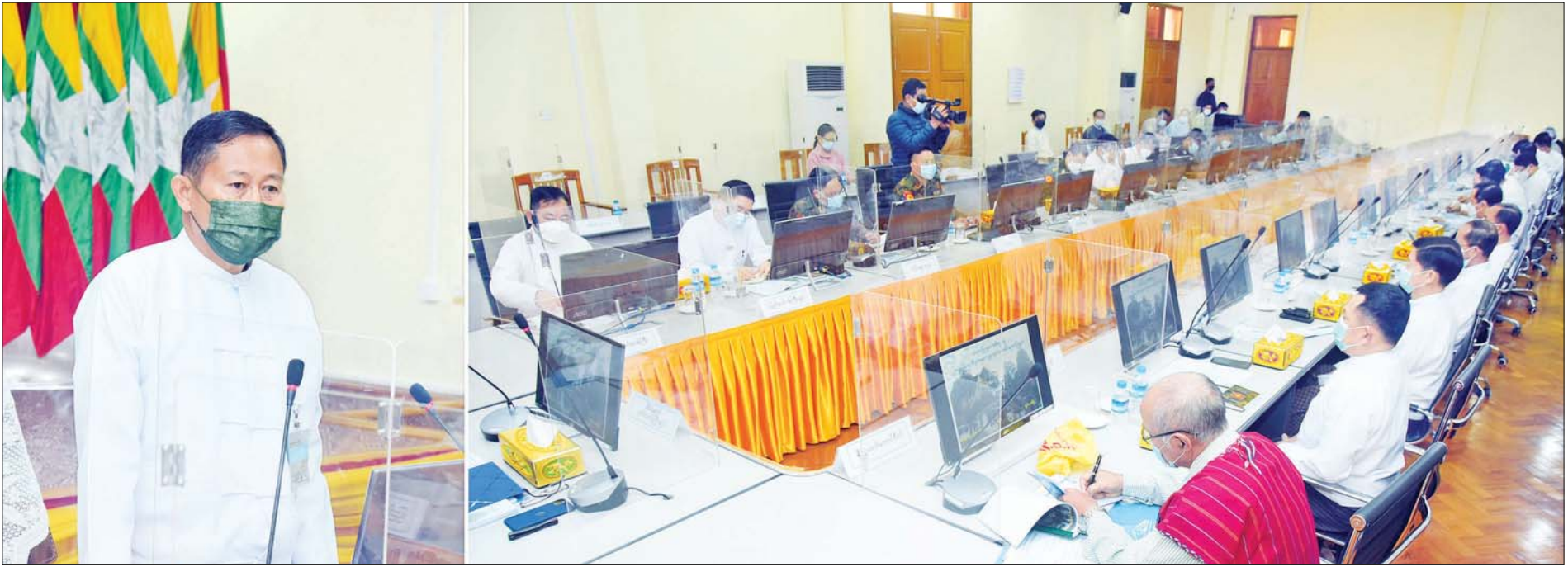
နိုင်ငံတော်စီမံအုပ်ချုပ်ရေးကောင်စီ ဒုတိယဥက္ကဋ္ဌ ဒုတိယတပ်မတော်ကာကွယ်ရေးဦးစီးချုပ် ကာကွယ်ရေးဦးစီးချုပ်(ကြည်း) ဒုတိယဗိုလ်ချုပ်မှူးကြီး စိုးဝင်း ကယားပြည်နယ်အစိုးရအဖွဲ့ဝင်များ၊ ပြည်နယ်အဆင့်ဌာနဆိုင်ရာများအား တွေ့ဆုံအမှာစကားပြောကြားစဉ်။

၄။ တစ်နိုင်ငံလုံး ထာဝရငြိမ်းချမ်းရေးရရှိရေးအတွက် တစ်နိုင်ငံလုံး ပစ်ခတ်တိုက်ခိုက်မှု ရပ်စဲရေးသဘောတူစာချုပ် (NCA) ပါ သဘောတူညီချက်များအတိုင်း ဖြစ်နိုင်သမျှ အလေးထား လုပ်ဆောင်သွားမည်။ ၅။ အရေးပေါ်ကာလဆိုင်ရာ ပြဋ္ဌာန်းချက်များနှင့်အညီ ဆောင်ရွက်ပြီးစီးပါက ဖွဲ့စည်းပုံအခြေခံဥပဒေ (၂၀၀၈ ခုနှစ်) နှင့်အညီ လွတ်လပ်ပြီး တရားမျှတသော ပါတီစုံဒီမိုကရေစီအထွေထွေရွေးကောက်ပွဲအား ပြန်လည်ကျင်းပ၍ အနိုင်ရသည့်ပါတီအား ဒီမိုကရေစီစံနှုန်းများနှင့်အညီ နိုင်ငံတော်တာဝန်အား လွှဲအပ်နိုင်ရေး ဆက်လက်ဆောင်ရွက်သွားမည်။