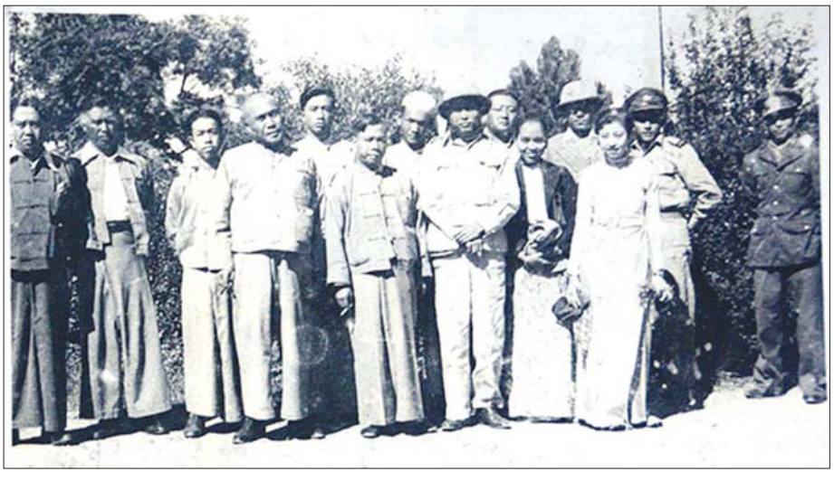
တောင်တန်း-ပြည်မ ပေါင်းစည်းညီညွတ်ရေးအတွက် ဗိုလ်ချုပ်အောင်ဆန်း၏ ပင်လုံခရီးစဉ်။ (ရှေ့တန်းဝဲမှ ဒုတိယ သာမိုင်းခမ်းစော်ဘွားစစ်ထွန်းအေး၊ ဗိုလ်ချုပ်အောင်ဆန်း၊ ဒေါ်ခင်ကြည်၊ ညာစွန်း သာမိုင်းခမ်းမဟာဒေဝီ၊ နောက်တန်းဝဲမှ တတိယ ပင်းတယစော်ဘွား စဝ်ဝင်းကြည်)

အနောက်ဂျပန်ကမူ “အမျိုးဟာအမျိုးပဲ၊ အဖြူ အနီဝါဒ၊ ကွန်မြူနစ်ဝါဒမလို၊ ဂျပန်ဟာ သွေးရင်း သားရင်းမို့ ပေါင်းပါမယ်” ဆို၏။ ဒါပေမယ့် အနောက်အုပ်စုအဖွဲ့က ကွန်မြူနစ်ဝါဒကို စွန့်မှတ်၊ ယင်းဖြင့် အရှေ့ဂျပန်မှာ ပြည်နယ်ငါးခုကို ကွန်မြူနစ်