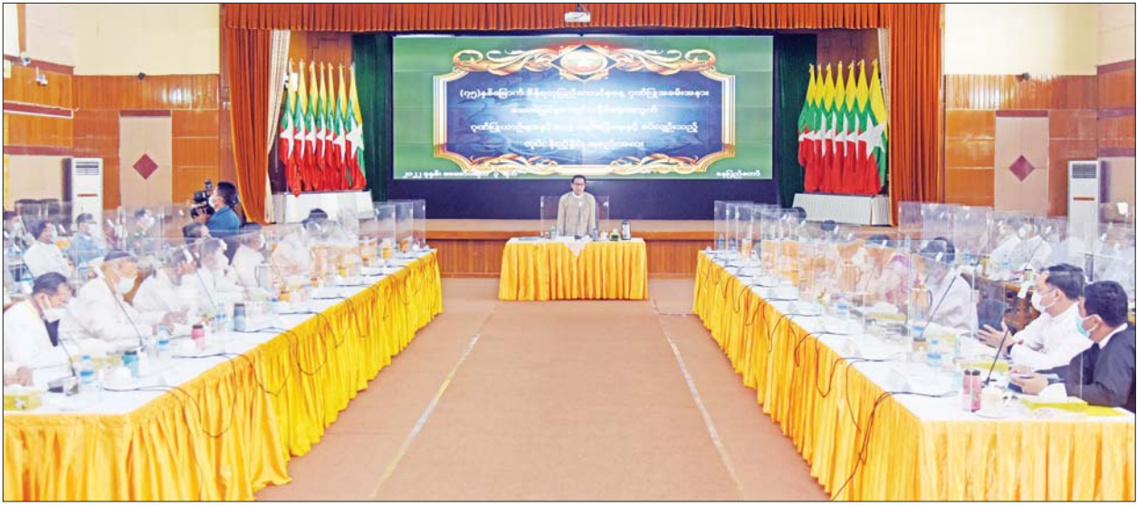
(၇၅) နှစ်မြောက် စိန်ရတုပြည်ထောင်စုနေ့ ဂုဏ်ပြုအခမ်းအနားတွင် ဂုဏ်ပြုယာဉ်များနှင့်အတူ ဖျော်ဖြေရေးနှင့် စပ်လျဉ်းသည့် လုပ်ငန်းညှိနှိုင်းစည်းဝေး ကျင်းပစဉ်။

အခမ်းအနားတွင် (၇၅)နှစ်မြောက် စိန်ရတုပြည်ထောင်စုနေ့ ဌာန ပြည်ထောင်စုဝန်ကြီး ဦးမောင်မောင်အုန်းက ယခုအခါ အားလုံး