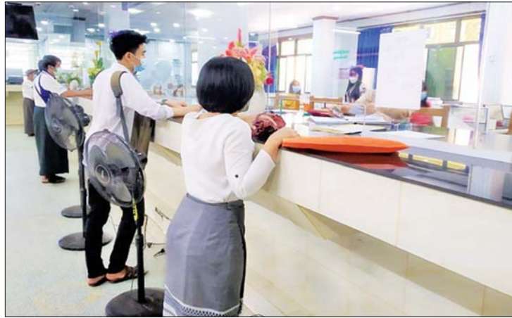
မြန်မာ့အာမခံလုပ်ငန်း ငွေသွင်းကောင်တာတွင် ပရီမီယံကြေးပေးသွင်းနေပုံ။

ပရီမီယံပေးဆောင်ရသည့် အကြောင်းရင်း သူတစ်ပါး ထိခိုက်မှုအာမခံသည် နိုင်ငံတကာနည်းတူ ၁၉၇၆-ခုနှစ်၊ ဇူလိုင်(၁)ရက် သူတစ်ပါးထိခိုက်မှုအာမခံ နည်းဥပဒေအရ မထားမနေရထားရှိရခြင်းဖြစ်ပါသည်။ စက်တပ်ယာဉ်ဖြင့် မတော်တဆထိခိုက်မှုကြောင့် သေဆုံးသူ၊ ဒဏ်ရာရသူ၊ ပစ္စည်းဆုံးရှုံးခြင်းခံရသည့် နစ်နာမှုများအတွက် စက်တပ်ယာဉ်ပိုင်ရှင်မှ ပေးလျော်ရန် တာဝန်ရှိရာ ထိုပေးလျော်ရန်တာဝန်ကို မြန်မာ့အာမခံလုပ်ငန်းအနေဖြင့် ပံ့ပိုးပြောင်းတာဝန်ယူသည့် စနစ်ဖြစ်ပါသည်။ စက်တပ်ယာဉ် စက်တပ်ယာဉ်ဆိုသည်မှာ စက်အားကို ဖြစ်စေ၊ လျှပ်စစ်ဓာတ်အားကိုဖြစ်စေ၊ အခြားစွမ်းအင်တစ်မျိုးမျိုးကို ဖြစ်စေ အသုံးပြု၍ မောင်းနှင်ရွေ့လျားနိုင်သော ယာဉ်နှင့်ယန္တရားများကို ဆိုလိုပါသည်။