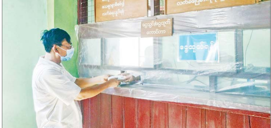
ပြည်ထောင်စုနယ်မြေ နေပြည်တော်၌ ၂၀၂၂ ခုနှစ် မိုးကြိုစိုက်ပျိုးစရိတ်ချေးငွေများ ထုတ်ချေးပေးနေစဉ်။

နေပြည်တော် ဖေဖော်ဝါရီ ၃ စီမံကိန်းနှင့် ဘဏ္ဍာရေးဝန်ကြီး ဌာန၊ နေပြည်တော် မြန်မာ့ လယ်ယာ ဖွံ့ဖြိုးရေးဘဏ်၊ လယ်ဝေးခရိုင်ဘဏ်ခွဲမှ တောင်သူ ဦးကြီးများကို ၂၀၂၂ ခုနှစ် မိုးကြို ရာသီစိုက်ပျိုးစရိတ် ချေးငွေများ ထုတ်ချေးပေးခြင်းကို ယနေ့နံနက် ကိုဗစ်-၁၉ ရောဂါ ကာကွယ် ထိန်းချုပ်ရေး ညွှန်ကြားချက်များ နှင့်အညီ ဆက်လက်ထုတ်ချေး ပေးလျက်ရှိကြောင်း သိရသည်။ နိုင်ငံအတွင်း စားနပ်ရိက္ခာ ပူလုံစေရေး၊ လယ်ယာကဏ္ဍဖွံ့ဖြိုး တိုးတက်စေရေးနှင့် တောင်သူ လယ်သမားများ၏ စိုက်ပျိုးစရိတ် ထုတ်လုပ်မှု အထောက်အကူ ဖြစ်စေရေးအတွက် ၂၀၂၂ ခုနှစ် မိုးကြိုရာသီ စိုက်ပျိုးစရိတ်ချေးငွေ များကို မိုးစပါး တစ်ဧကလျှင် ငွေကျပ် ၁၅၀၀၀ နှုန်းဖြင့် အတိုး နှုန်း တစ်နှစ်လျှင် ၅ ရာခိုင်နှုန်းဖြင့် ထုတ်ချေးပေးလျက်ရှိသည်။ ထိုသို့ ထုတ်ချေးရာတွင် ယနေ့နံနက် ပိုင်းက လယ်ဝေးမြို့နယ် ဇေလီ ငှက်ကြီးတောင် အုပ်စုတို့မှ တောင်သူ ကိုးဦးတို့အား ချက်ကြိ