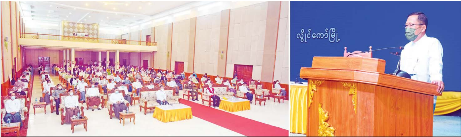
နိုင်ငံတော်စီမံအုပ်ချုပ်ရေးကောင်စီ ဒုတိယဥက္ကဋ္ဌ ဒုတိယတပ်မတော်ကာကွယ်ရေးဦးစီးချုပ် ကာကွယ်ရေးဦးစီးချုပ်(ကြည်း) ဒုတိယဗိုလ်ချုပ်မှူးကြီး စိုးဝင်း ကယားပြည်နယ်ရှိ ခရိုင်၊ မြို့နယ်အဆင့် ဌာနဆိုင်ရာ ဝန်ထမ်းများနှင့် မြို့မိမြို့ဖများအား တွေ့ဆုံအမှာစကားပြောကြားစဉ်။