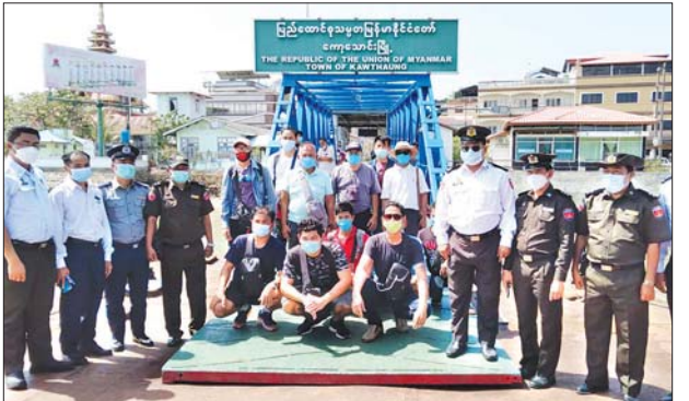
ကော့သောင်းမြို့နယ်စပ်ဂိတ်မှ ကော့သောင်းခရိုင် လူဝင်မှုကြီးကြပ်ရေး နှင့် ပြည်သူ့အင်အားဦးစီးဌာန ဌာနခွဲ(၂)နှင့် မြို့နယ်ဦးစီးဌာနမှူးရုံးတို့မှ တာဝန်ရှိသူများက ထိုင်းနိုင်ငံ ရနောင်းမြို့ ဒေသအာဏာပိုင်အဖွဲ့အစည်း များထံသို့ ပြန်လည်ပို့ဆောင် လွှဲပြောင်းပေးအပ်ခဲ့ခြင်းဖြစ်ကြောင်း သိရသည်။ ကျော်စိုး(ကော့သောင်း)

ကော့သောင်း ဖေဖော်ဝါရီ ၃ ကိုဗစ်-၁၉ ရောဂါ ထိန်းချုပ်မှုကာလအတွင်း မြိတ်မြို့တွင် ပိတ်မိနေခဲ့ သည့် ထိုင်းနိုင်ငံပိုင် ငါးသယ်လှေတစ်စင်းမှ လှေလုပ်သား ထိုင်းနိုင်ငံ သား ၁၂ ဦးအား ဇန်နဝါရီ ၃၀ ရက်က အပြည်ပြည်ဆိုင်ရာ နယ်စပ် ဂိတ်တစ်ခုဖြစ်သည့် ကော့သောင်းနယ်စပ်ဂိတ်၊ မြို့မတံတားမှတစ်ဆင့် ကော့သောင်းခရိုင် တာဝန်ရှိအဖွဲ့အစည်းများက ထိုင်းနိုင်ငံ ရနောင်းမြို့ သို့ ပြည်နှင့်ဒဏ်ပေး ပြန်လည်သွားရောက် လွှဲပြောင်းပေးအပ်ခဲ့ကြောင်း သိရသည်။ အဆိုပါ ထိုင်းနိုင်ငံသားများမှာ လွန်ခဲ့သည့်နှစ်က ထိုင်းနိုင်ငံမှ တစ်ဆင့် မြန်မာနိုင်ငံကို ဖြတ်သန်းကာ ပြည်ပနိုင်ငံတစ်ခုသို့ ငါးသယ်ယူ ရန် ထွက်ခွာလာခဲ့စဉ် ကိုဗစ်-၁၉ ရောဂါထိန်းချုပ်မှုကာလ မြိတ်မြို့တွင် ပိတ်မိနေခဲ့ပြီး မြိတ်မြို့တွင်ရှိနေစဉ် ကာလအတွင်း မြန်မာနိုင်ငံ၏ ကိုဗစ်-၁၉ ရောဂါ ထိန်းချုပ်မှုစည်းကမ်းချက်များကို ကျူးလွန်ဖောက် ဖျက်ခဲ့သဖြင့် ဒဏ်ငွေတပ်ရိုက်အရေးယူကာ ပြည်နှင့်ဒဏ်ပေးမှုခံခဲ့ရပြီး မြိတ်မြို့မှတစ်ဆင့် အပြည်ပြည်ဆိုင်ရာ နယ်စပ်ဂိတ်တစ်ခုဖြစ်သည့်