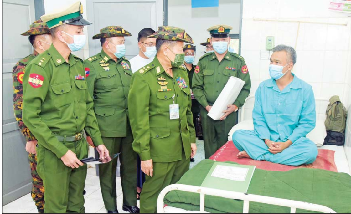
နိုင်ငံတော်စီမံအုပ်ချုပ်ရေးကောင်စီ ဒုတိယဥက္ကဋ္ဌ ဒုတိယတပ်မတော်ကာကွယ်ရေးဦးစီးချုပ် ကာကွယ်ရေးဦးစီးချုပ် (ကြည်း) ဒုတိယဗိုလ်ချုပ်မှူးကြီး စိုးဝင်း လှိုင်ကော်မြို့၊ တပ်မတော်ဆေးရုံ၌ တက်ရောက်ဆေးကုသမှု ခံယူလျက်ရှိသည့် စစ်သည်တစ်ဦးအား ရင်းရင်းနှီးနှီး ကြည့်ရှုအားပေးစကား ပြောကြားစဉ်။

နိုင်ငံတော်စီမံအုပ်ချုပ်ရေးကောင်စီ ဒုတိယဥက္ကဋ္ဌနှင့် ခရီးစဉ်တွင် လိုက်ပါလာသည့် နိုင်ငံတော်စီမံအုပ်ချုပ်ရေးကောင်စီဝင် ဦးစောဒန်နီယယ်၊ ဒုတိယဗိုလ်ချုပ်မှူးကြီး စိုးထွန်းနှင့် အဖွဲ့ဝင်များသည် ဖယ်ခုံမြို့နယ်ရှိ မြို့နယ်စီမံအုပ်ချုပ်ရေးကောင်စီအဖွဲ့ဝင်များ၊ ဌာနဆိုင်ရာ တာဝန်ရှိသူများအား နယ်မြေခံတပ်ဌာနချုပ်ခန်းမ၌ တွေ့ဆုံခဲ့ပြီး ၎င်းတို့၏ တင်ပြချက်များအပေါ် လိုအပ်သည်များ ညှိနှိုင်းဖြည့်ဆည်း ဆောင်ရွက်ပေးခဲ့ကြောင်း သတင်းရရှိသည်။