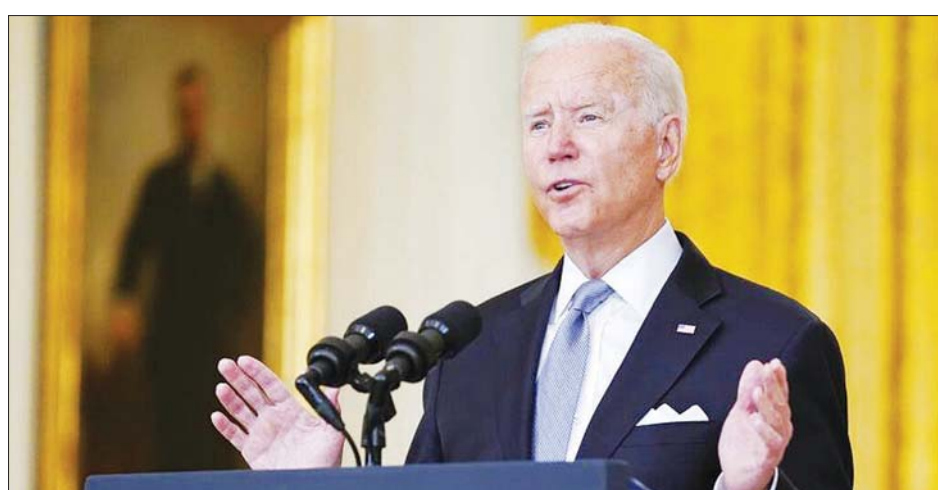
အမေရိကန်သမ္မတ ဂျိုးဘိုင်ဒင်။