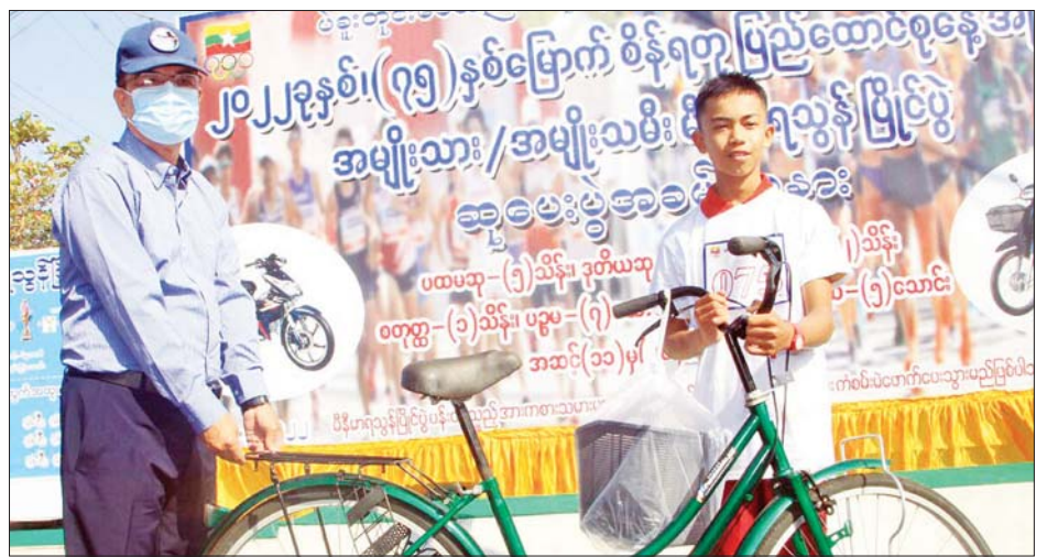
တို့ကို ကံစမ်းမဲဖောက်ပေးသည်။ အဆိုပါ (၇၅) နှစ်မြောက် စိန်ရတုပြည်ထောင်စုနေ့ အကြို အမျိုးသား အမျိုးသမီး မိနီမာရသွန်ပြိုင်ပွဲ သို့ အမျိုးသား ၂၆၆ ဦး၊ အမျိုးသမီး ၁၁၈ ဦး စုစုပေါင်း ၃၈၄ ဦး ပါဝင်ယှဉ်ပြိုင်ခဲ့ကြကြောင်း သိရသည်။ သတင်းစဉ်

ငွေကျပ် ခုနစ်သောင်းစီနှင့် စတုတ္ထဆုရရှိသူ တစ်ဦးလျှင် ဂုဏ်ပြုဆုငွေကျပ် တစ်သိန်းစီတို့ကို ပေးအပ် ချီးမြှင့်သည်။ ယင်းနောက် တိုင်းဒေသကြီး ဝန်ကြီးချုပ် ဦးမျိုးဆွေဝင်းက အသက် ၅၀ နှစ်အထက် ပြိုင်ပွဲ ဝင် အားကစားသမား နှစ်ဦးနှင့် အသက် ၁၂ အောက် အားကစားသမား ၃၄ ဦးတို့အား တစ်ဦးလျှင် ဂုဏ်ပြုဆုငွေကျပ် ငါးသောင်းစီ၊ ပထမဆုရရှိသူ နှစ်ဦးအား တစ်ဦးလျှင် ဂုဏ်ပြုဆုငွေကျပ် ငါးသိန်းစီ၊ ဒုတိယဆုရရှိသူ နှစ်ဦးအား တစ်ဦးလျှင် ဂုဏ်ပြုဆုငွေကျပ် သုံးသိန်းစီ၊ တတိယ ဆုရရှိသူ နှစ်ဦးအား တစ်ဦးလျှင် ဂုဏ်ပြုဆုငွေကျပ် နှစ်သိန်းစီ ပေးအပ် ချီးမြှင့်ပြီး ဆိုင်ကယ် နှစ်စီးနှင့် စက်ဘီး ၂၅ စီး