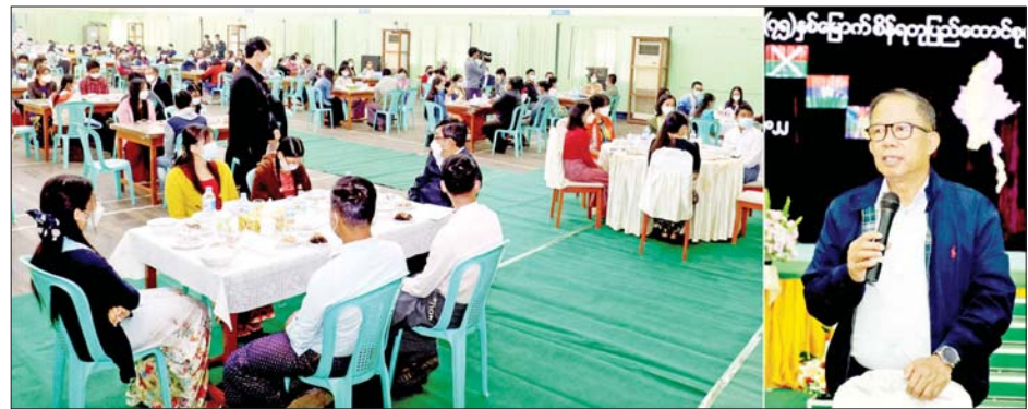
စိန်ရတုပြည်ထောင်စုနေ့အကြို အထိမ်းအမှတ် ပျော်ပွဲရွှင်ပွဲနှင့် တိုင်းရင်းသားရိုးရာအစားအသောက် ရက်သတ္တပတ်အခမ်းအနား၌ ပြည်ထောင်စုဝန်ကြီးက အမှာစကားပြောကြားစဉ်။

စိန်ရတုပြည်ထောင်စုနေ့အကြို အထိမ်းအမှတ် ပျော်ပွဲရွှင်ပွဲနှင့် တိုင်းရင်းသားရိုးရာ အစားအသောက် ရက်သတ္တပတ်အခမ်းအနားကို ယနေ့နံနက်ပိုင်းက မွေးမြူရေးဆိုင်ရာ ဆေးတက္ကသိုလ် ရွှေရတုခန်းမ၌ ကျင်းပသည်။