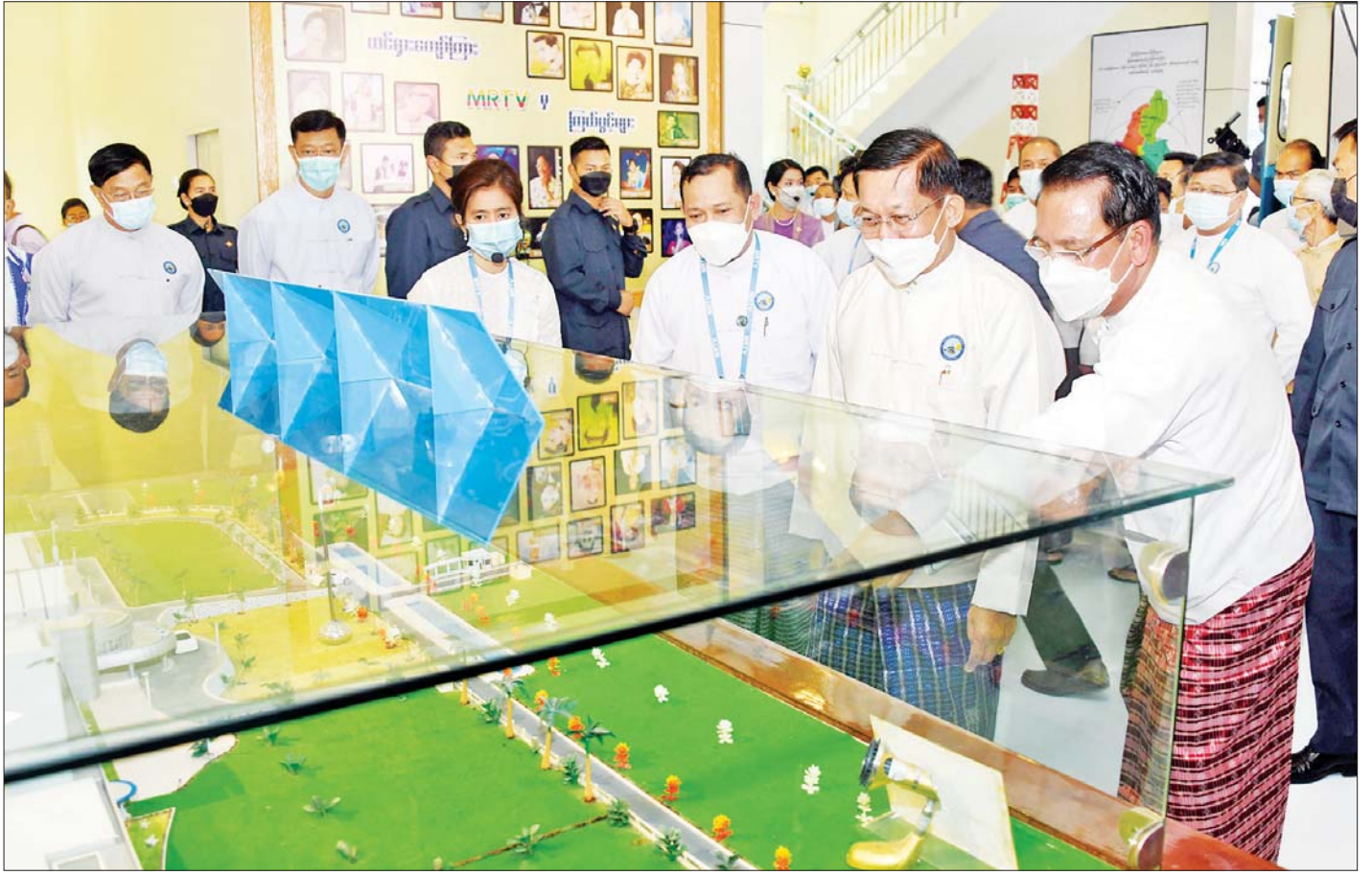
နိုင်ငံတော်စီမံအုပ်ချုပ်ရေးကောင်စီဥက္ကဋ္ဌ နိုင်ငံတော်ဝန်ကြီးချုပ် ဗိုလ်ချုပ်မှူးကြီး မင်းအောင်လှိုင်နှင့် အဖွဲ့ဝင်များ စိန်ရတုပြတိုက်အတွင်း လှည့်လည်ကြည့်ရှုစဉ်။

MRTV အနေဖြင့် ဖြတ်သန်းခဲ့သည့် (၇၅)နှစ်တာ ကာလအတွင်း တိုင်းကျိုးပြည်ပြု လုပ်ငန်းများတွင်