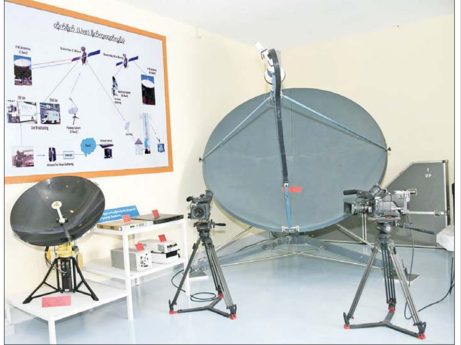
တိုက်ရိုက်(live) ရိုက်ကူးထုတ်လွှင့်သည့် စက်ပစ္စည်းများ။