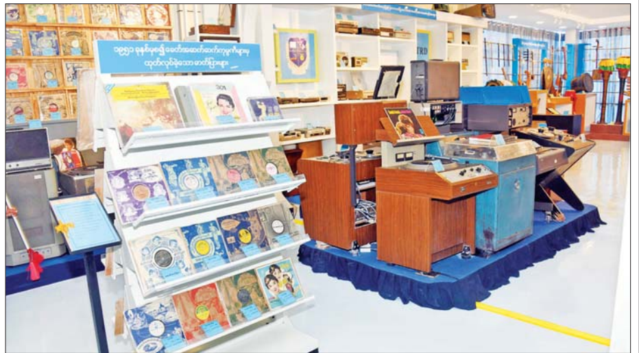
၁၉၅၁ ခုနှစ်မှစ၍ ခေတ်အဆက်ဆက် ကုမ္ပဏီများမှ ထုတ်လုပ်ခဲ့သော ဓာတ်ပြားများ။