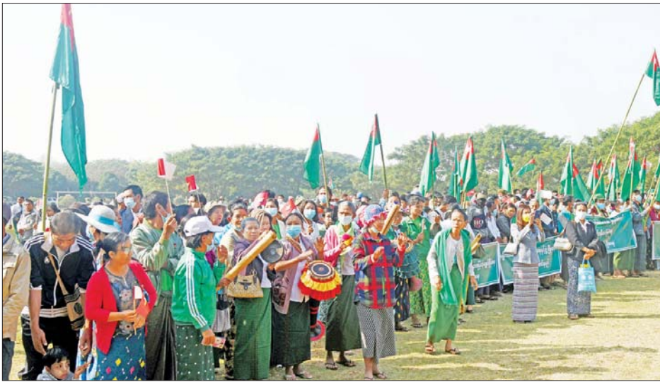
နေပြည်တော်တွင် နိုင်ငံတော်စီမံအုပ်ချုပ်ရေးကောင်စီအား ထောက်ခံပွဲပြုလုပ်စဉ်။