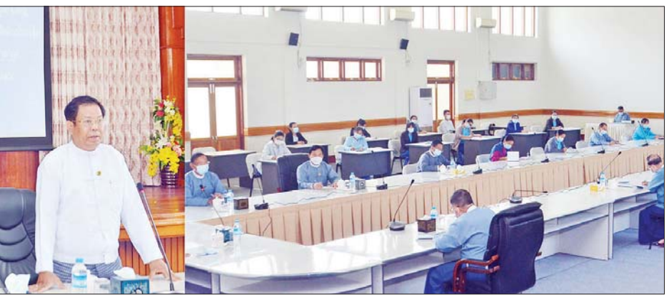
ပြည်ထောင်စုရာထူးဝန်အဖွဲ့ဥက္ကဋ္ဌ ဦးသန်းဆွေ အခြေခံ ကွန်ပျူတာ မှမ်းမံသင်တန်းဖွင့်ပွဲအခမ်းအနား တွင် အမှာစကားပြောကြားစဉ်။

ပြည်ထောင်စုရာထူးဝန်အဖွဲ့တွင် တာဝန်ထမ်းဆောင်လျက်ရှိသည့် အရာထမ်း၊ အမှုထမ်းများအနေ ဖြင့် ကွန်ပျူတာအခြေခံသဘော တရားများအား ပိုမိုသိရှိနားလည် ပြီး လုပ်ငန်းခွင်တွင် ပြန်လည် အသုံးပြုနိုင်စေရန်အတွက် အခြေခံ ကွန်ပျူတာ မှမ်းမံသင်တန်းဖွင့်ပွဲ အခမ်းအနားကို ယနေ့နံနက် ၁၀ နာရီခွဲက ကိုဗစ်-၁၉ ရောဂါ ဆိုင်ရာ ထုတ်ပြန်ထားရှိသော စည်းကမ်းသတ်မှတ်ချက်များနှင့် အညီ ပြည်ထောင်စုရာထူးဝန်အဖွဲ့ ရုံးအမှတ် (၁၇) စုပေါင်းခန်းမတွင် ကျင်းပသည်။