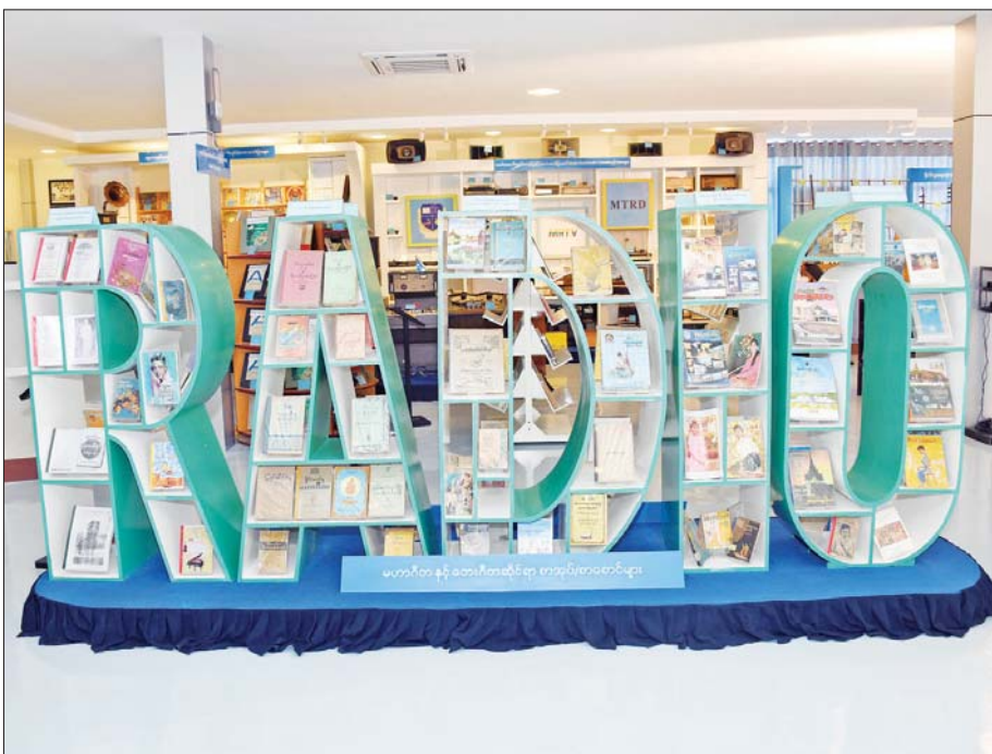
မဟာဂီတနှင့် တေးဂီတဆိုင်ရာ စာအုပ်/စာစောင်များ။