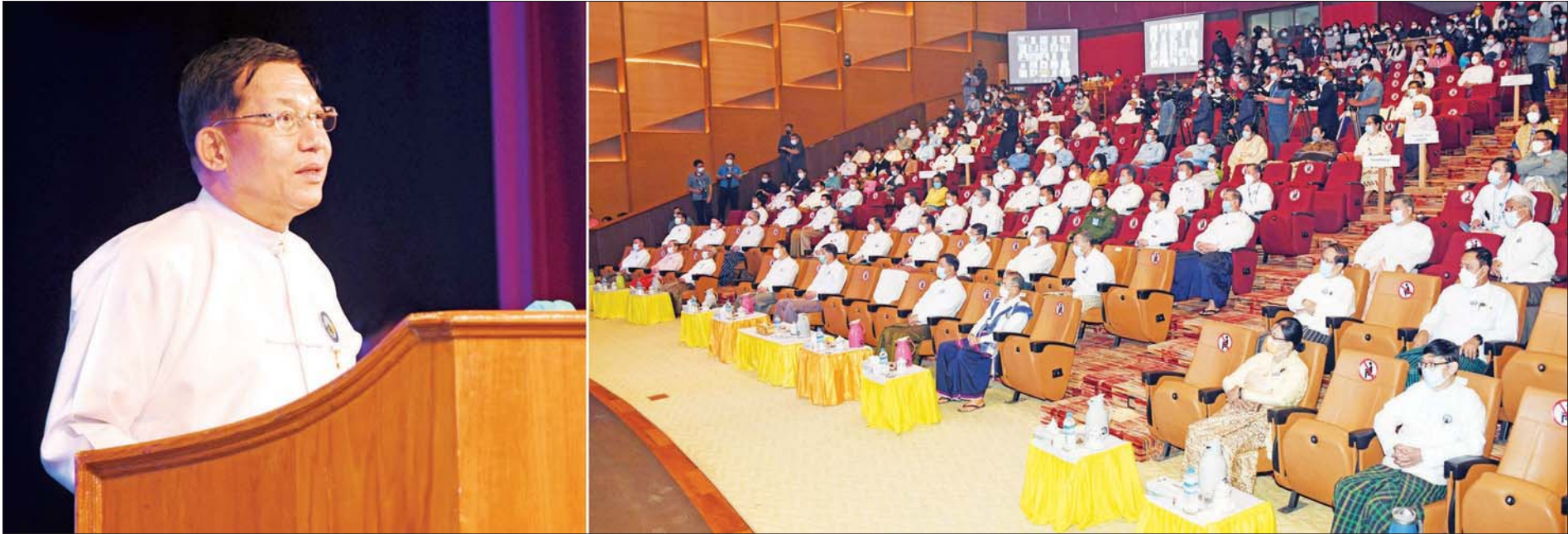
နိုင်ငံတော်စီမံအုပ်ချုပ်ရေးကောင်စီဥက္ကဋ္ဌ နိုင်ငံတော်ဝန်ကြီးချုပ် ဗိုလ်ချုပ်မှူးကြီး မင်းအောင်လှိုင် (၇၅)နှစ်မြောက် စိန်ရတုပြည်ထောင်စုနေ့ကို ကြိုဆိုဂုဏ်ပြုသောအားဖြင့် နိုင်ငံတော်စီမံအုပ်ချုပ်ရေးကောင်စီတာဝန်ထမ်းဆောင်ခဲ့သည့် တစ်နှစ်မြောက် နှစ်ပတ်လည်နေ့အထိမ်းအမှတ် မြန်မာ့အသံနှင့်ရုပ်မြင်သံကြား စိန်ရတုပြတိုက်၊ MRTV News Channel နှင့် MRTV DTH စနစ် ဖွင့်လှစ်ခြင်းအခမ်းအနားတွင် အမှာစကားပြောကြားစဉ်။

တိုင်းရင်းသားပြည်သူများခင်ဗျား- ဒီနေ့ဟာဆိုရင် ကျွန်တော်တို့ နိုင်ငံတော်စီမံအုပ်ချုပ်ရေးကောင်စီက နိုင်ငံတော်ရဲ့ တာဝန်ကို ထမ်းဆောင်ခဲ့တာ (၁)နှစ်ပြည့်မြောက်တဲ့နေ့ဖြစ်ပါတယ်။ တိုင်းရင်းသားပြည်သူများအားလုံး ကြုံတွေ့နေရတဲ့ ကိုဗစ်-၁၉ ကပ်ရောဂါဘေးမှ ကင်းဝေးပြီး ကိုယ်၏ကျန်းမာခြင်း၊ စိတ်၏ ချမ်းသာခြင်းတို့နှင့် ပြည့်စုံပါစေကြောင်း ဦးစွာဆုတောင်း မေတ္တာပို့သလိုက်ပါတယ်။ တိုင်းရင်းသားပြည်သူများခင်ဗျား- တပ်မတော်က နိုင်ငံတော်တာဝန် ရယူထိန်းသိမ်းခဲ့ရတဲ့ အခြေအနေတွေနဲ့ ပတ်သက်ပြီး တင်ပြချင်ပါတယ်- မြန်မာနိုင်ငံရဲ့ ရွေးကောက်ပွဲဟာ ၅ နှစ်တစ်ကြိမ် ပြုလုပ်ပြီး ပြည်သူ့လွှတ်တော်၊ အမျိုးသားလွှတ်တော်နဲ့ တိုင်းဒေသကြီးနဲ့ ပြည်နယ်လွှတ်တော်ကိုယ်စားလှယ်တွေကို ရွေးချယ်တဲ့ အထွေထွေရွေးကောက်ပွဲဖြစ်ပါတယ်။ အဲဒီ လွှတ်တော်ကိုယ်စားလှယ်တွေနဲ့ တပ်မတော်သားလွှတ်တော်ကိုယ်စားလှယ်တွေပါဝင်တဲ့ ပြည်ထောင်စုလွှတ်တော်ကနေ နိုင်ငံတော်ဒုတိယသမ္မတများ၊ အဲဒီထဲကမှ နိုင်ငံတော်သမ္မတကို စာမျက်နှာ ၁၀ ကော်လံ ၁၀