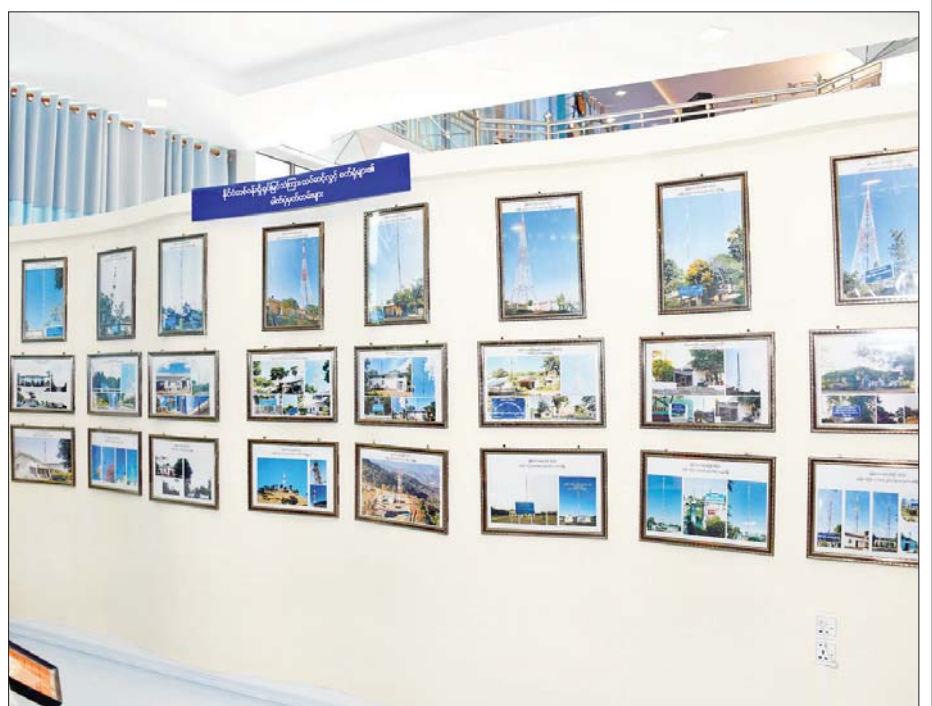
နိုင်ငံတစ်ဝန်းရှိ ရုပ်မြင်သံကြားထပ်ဆင့်ထုတ်လွှင့် စက်ရုံများ၏ ဓာတ်ပုံမှတ်တမ်းများ။