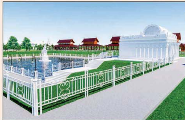
မုစလိန္နုအိုင်

၁။ နိုင်ငံတော်စီမံအုပ်ချုပ်ရေးကောင်စီဥက္ကဋ္ဌ၊ တပ်မတော်ကာကွယ်ရေးဦးစီးချုပ် ဗိုလ်ချုပ်မှူးကြီးမင်းအောင်လှိုင် ဦးဆောင်သည့် (၇)ရက်သား၊ သမီး၊ ဘုရားဒါယကာ၊ ဒါယိကာမတို့က မာရဝိဇယပုဒ္ဓရုပ်ပွားတော်မြတ်ကြီးအား မြန်မာနိုင်ငံတွင် ထေရဝါဒပုဒ္ဓသာသနာတော်ထွန်းလင်းတောက်ပလျက်ရှိသည်ကို ကမ္ဘာကိုပြသရန်၊ တိုင်းပြည်အေးချမ်းသာယာမှုရှိစေရန်၊ ရုပ်ပွားတော်မြတ်ကြီးအား ပြည်တွင်း၊ ပြည်ပဘုရားဖူးများလာရောက်ခြင်းဖြင့် ဒေသတိုးတက်စည်ကားမှုကို အထောက်အကူဖြစ်စေရန်၊ နိုင်ငံတော်ဖွံ့ဖြိုးတိုးတက်မှုအား အထောက်အကူဖြစ်စေရန် ရည်သန်လျက် ပြည်ထောင်စုနယ်မြေ နေပြည်တော်၊ ဒက္ခိဏသီရိမြို့နယ်အတွင်း၌ သာသနာတော်ထိုး၊ ရုပ်ပွားဆင်းတုတော်ထိုး၊ မြန်မာ့ရိုးရာတည်ထုံးများနှင့်အညီ တည်ဆောက်ပူဇော်လျက် ရှိပါသည်။