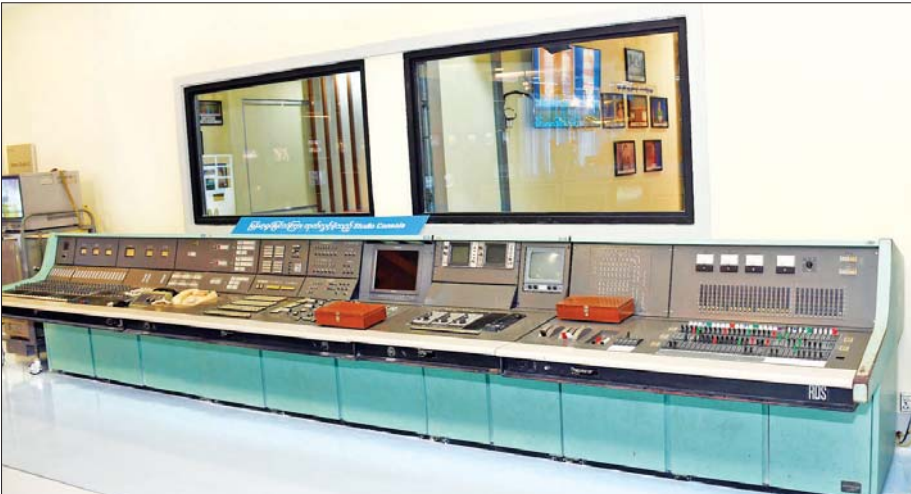
မြန်မာ့ရုပ်မြင်သံကြား ထုတ်လွှင့်ခဲ့သည့် Studio Console ။