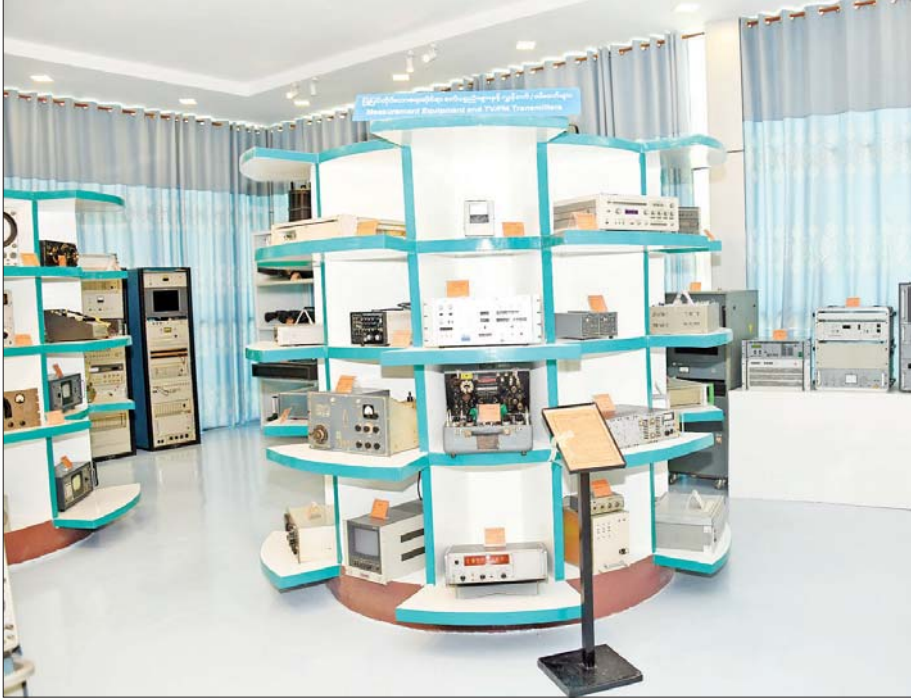
ပြုပြင်တိုင်းတာရေးဆိုင်ရာ စက်ပစ္စည်းများနှင့် လွှင့်စက်/ဖမ်းစက်များ။