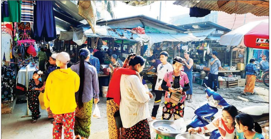
ကရင်ပြည်နယ် မြဝတီမြို့၌ ပြည်သူများ အသွားအလာမပျက် ပုံမှန်အတိုင်း ဈေးရောင်းဈေးဝယ်များဖြင့် စည်ကားနေမှုကို တွေ့ရစဉ်။ ထိန်လင်းအောင်