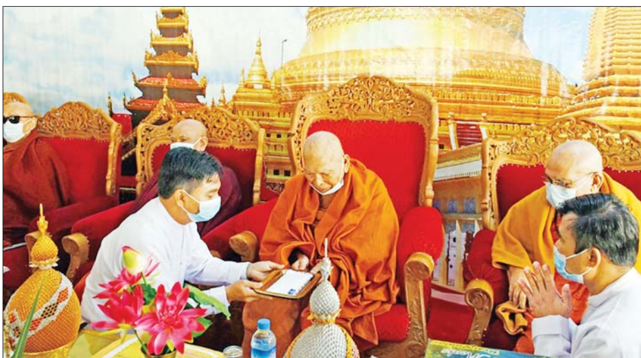
အတိုင်း ပြုလုပ်ကြသည်။ သူများက သံဃာတော်များအား ကြောင်း သတင်းရရှိသည်။ ဆက်လက်၍ တက်ရောက်လာကြ သိမ်းဆင်း လောင်းလှူခဲ့ကြ သတင်းစဉ်

ဗန်းမော်ကျောင်းတိုက် ဆရာ တော်နှင့် သံဃာတော်များအား လှူဖွယ်ပစ္စည်းများ ဆက်ကပ် လှူဒါန်းပြီး (ယာပုံ) အနုမောဒနာ တရားနာကြားကာ လှူဒါန်းမှု အစုစုတို့အတွက် ရေစက်သွန်းချ အမျှပေး ဝေကြသည်။ ယင်းနောက်ဗန်းမော်ကျောင်း တိုက် ဆရာတော်အမျိုးပြုသော သံဃာတော်များက ရွှေစည်းခုံ စေတီတော်မြတ်ကြီးအား လက် ယာရစ်ပတ်ကာ အန္တရာယ်ကင်း ပရိတ်တရားတော်များ ရွတ်ဖတ် ပူဇော်ပြီး သံဃာတော်များအား သိက္ခာထပ်မင်္ဂလာကို အစီအစဉ်