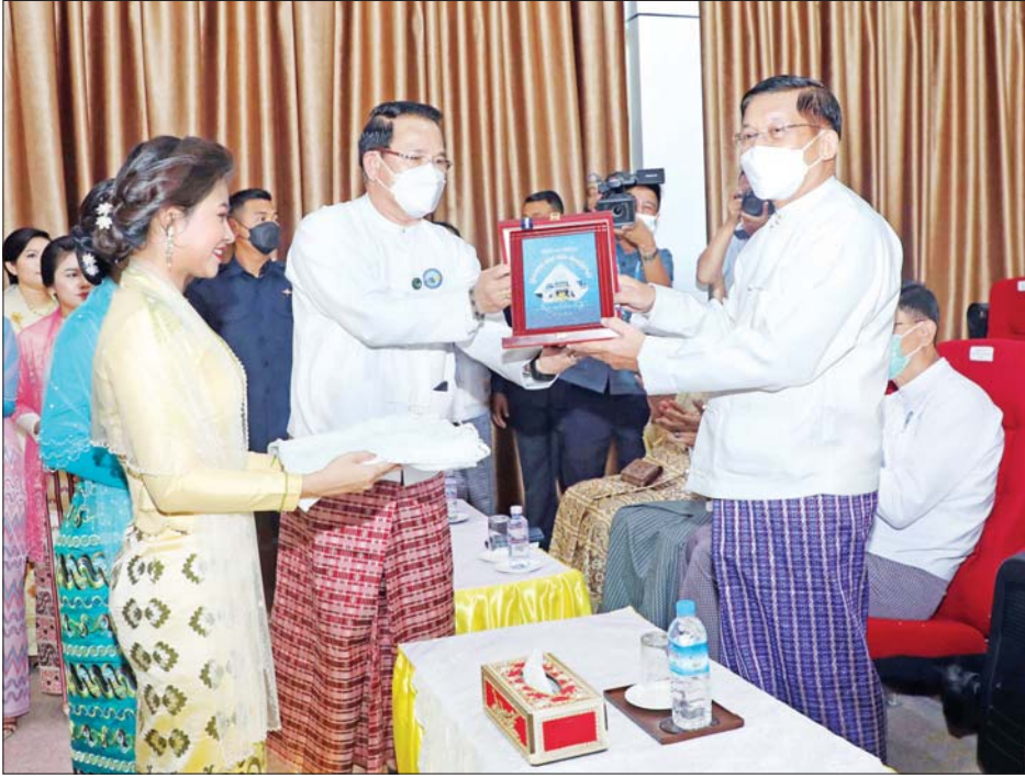
နိုင်ငံတော်စီမံအုပ်ချုပ်ရေးကောင်စီဥက္ကဋ္ဌ နိုင်ငံတော်ဝန်ကြီးချုပ် ဗိုလ်ချုပ်မှူးကြီး မင်းအောင်လှိုင်ထံ ပြည်ထောင်စုဝန်ကြီး ဦးမောင်မောင်အုန်းက စီနီရတုပြတိုက် ဖွင့်ပွဲအထိမ်းအမှတ်တံဆိပ်ကို ဂါရဝပြုပေးအပ်စဉ်။