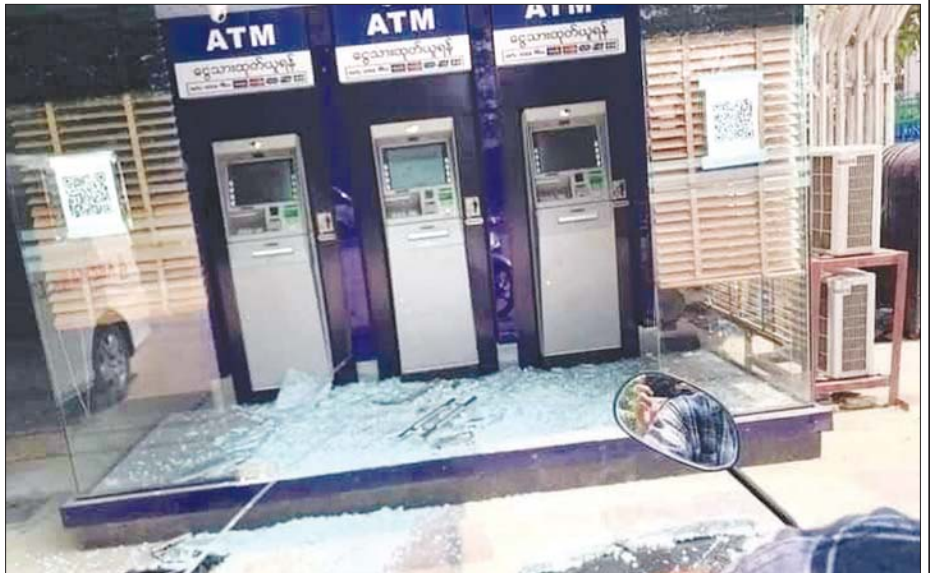
ငြိမ်းချမ်းစွာညှိနှိုင်းဖြေရှင်းသည့် ဒီမိုကရေစီ၏သဘောနှင့် ဆန့်ကျင်၍ ရန်ကုန်တိုင်းဒေသကြီးအတွင်းရှိ ATM စက်များကို ၂၀၂၁ ခုနှစ် မတ်လအတွင်းက အကြမ်းဖက်ဖျက်ဆီးထားစဉ်။