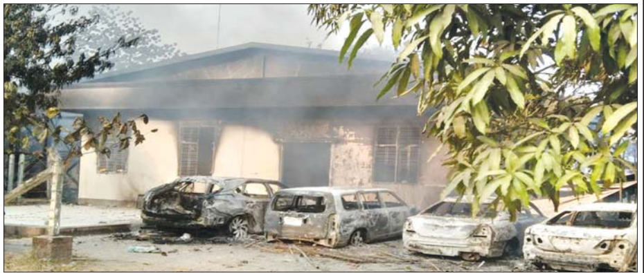
ဒီမိုကရေစီစနစ်၏ အနှစ်သာရများကို ပျက်ယွင်းစေသော မင်းမဲ့စရိုက်ဆန်သည့်လုပ်ရပ်ဖြင့် အကြမ်းဖက်သမားများက လှိုင်သာယာမြို့နယ်ရဲစခန်းကို ၂၀၂၁ ခုနှစ် မတ်လအတွင်းက တိုက်ခိုက်ပြီး မီးရှို့ဖျက်ဆီးထားမှု။

ထိုသို့ ဒီမိုကရေစီနည်းလမ်းများကို ပဋိပက္ခများဖြေရှင်းရေးအတွက် အသုံးပြုရာတွင် လူမှုအဖွဲ့