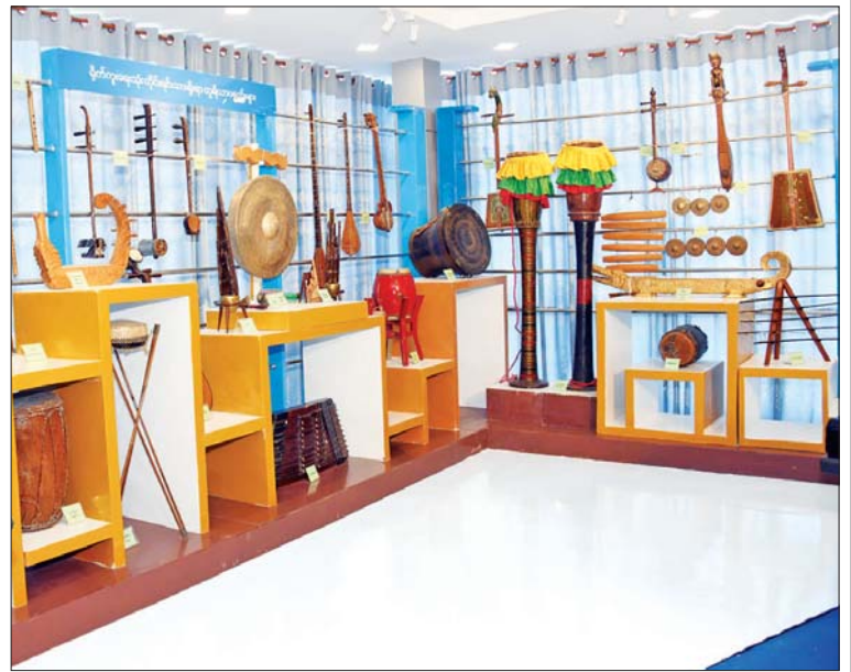
ရိုက်ကူးရေးသုံး တိုင်းရင်းသားရိုးရာ တူရိယာပစ္စည်းများ။