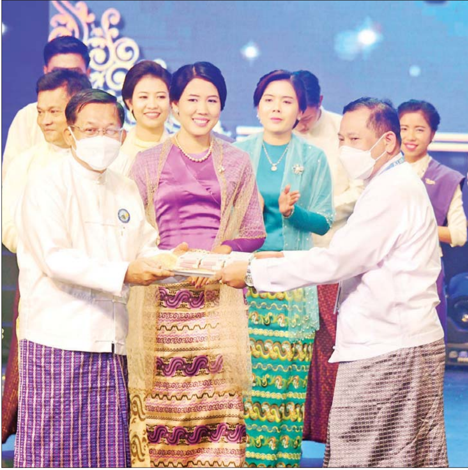
နိုင်ငံတော်စီမံအုပ်ချုပ်ရေးကောင်စီဥက္ကဋ္ဌ နိုင်ငံတော်ဝန်ကြီးချုပ် ဗိုလ်ချုပ်မှူးကြီး မင်းအောင်လှိုင် ဖျော်ဖြေတင်ဆက်ခဲ့ကြသည့် အနုပညာရှင်များနှင့် မြန်မာ့အသံနှင့် ရုပ်မြင်သံကြားဝန်ထမ်းများအတွက် ဂုဏ်ပြုဆုငွေများ ပေးအပ်စဉ်။

သရွေ့ ကြိုးပမ်းဆောင်ရွက်ရမည် ဖြစ်ပါကြောင်း။ ယနေ့အချိန်ကာလသည် ပြည်သူတစ်ရပ်လုံး လိုလားတောင့်တနေသည့် ဒီမိုကရေစီနှင့် ဖက်ဒရယ် စနစ်ကိုအခြေခံသည့် ပြည်ထောင်စုကြီး တည်ဆောက်နိုင်ရေးအတွက် တစ်နိုင်ငံလုံးထာဝရ ငြိမ်းချမ်းရေးဖော်ဆောင်နေချိန်ဖြစ်သလို နိုင်ငံတော် အစိုးရအနေဖြင့်လည်း တစ်နိုင်ငံလုံးတည်ငြိမ်အေး ချမ်းသည့်နိုင်ငံ၊ သာယာဝပြောသည့် နိုင်ငံ၊ နိုင်ငံတော် ကြီး ဘက်စုံဖွံ့ဖြိုးတိုးတက်စေရန် လမ်းပန်းဆက်သွယ် ရေး၊ လျှပ်စစ်ဓာတ်အားရရှိရေး၊ စိုက်ပျိုးရေး၊ မွေးမြူ ရေး၊ ပညာရေး၊ ကျန်းမာရေးစသည့် လူမှုစီးပွား ဖွံ့ဖြိုး တိုးတက်စေမည့် ကဏ္ဍအားလုံးကို ကိုယ်စွမ်း ညာဏ်စွမ်းရှိသရွေ့ ကြိုးပမ်းဆောင်ရွက်လျက်ရှိနေပါ ကြောင်း၊ ထို့ကြောင့် တိုင်းရင်းသားပြည်သူတစ်ရပ်လုံး ကလည်း ဝိုင်းဝန်းပူးပေါင်းဆောင်ရွက်ကြပါရန်နှင့်