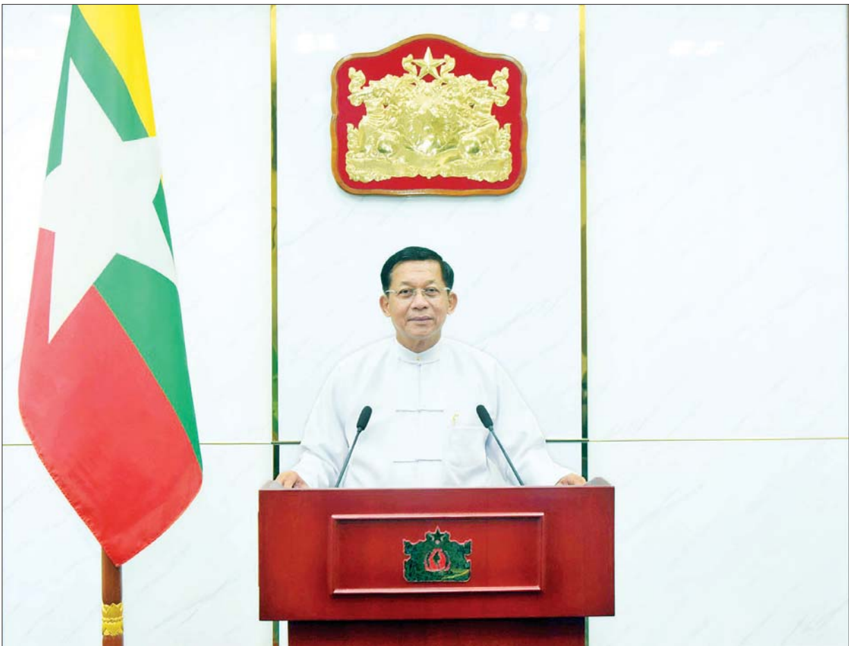
နိုင်ငံတော်စီမံအုပ်ချုပ်ရေးကောင်စီဥက္ကဋ္ဌ နိုင်ငံတော်ဝန်ကြီးချုပ် ဗိုလ်ချုပ်မှူးကြီး မင်းအောင်လှိုင် နိုင်ငံတော်စီမံအုပ်ချုပ်ရေးကောင်စီ၏ (၁)နှစ်ပြည့် နိုင်ငံတော်တာဝန်ထမ်းဆောင်ခဲ့မှုနှင့် ပတ်သက်၍ မိန့်ခွန်းပြောကြားစဉ်။

ကျွန်တော်တို့နိုင်ငံမှာ ပါတီစုံဒီမိုကရေစီစနစ် ရွေးကောက်ပွဲတွေ ကို ၂၀၁၀ ပြည့်နှစ်၊ ၂၀၁၅ ခုနှစ်တွေမှာ ကျင်းပခဲ့ပြီးဖြစ်ပါတယ်။ ဒီရွေးကောက်ပွဲတွေမှာ ရွေးကောက်ပွဲဆိုင်ရာ တိုင်ကြားမှုအချို့ရှိခဲ့ ပေမယ့် ပြေလည်အောင် ဖြေရှင်းနိုင်ခဲ့ပါတယ်။ ဒီ ၂၀၂၀ ပြည့်နှစ်