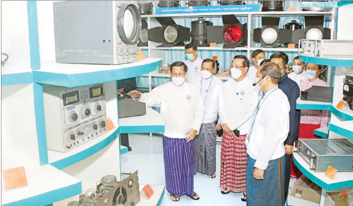
နိုင်ငံတော်စီမံအုပ်ချုပ်ရေးကောင်စီဥက္ကဋ္ဌ နိုင်ငံတော်ဝန်ကြီးချုပ် ဗိုလ်ချုပ်မှူးကြီး မင်းအောင်လှိုင်နှင့် အဖွဲ့ဝင်များ ခေတ်အဆက်ဆက် အသုံးပြုခဲ့သည့် စက်ပစ္စည်းကိရိယာများကို ကြည့်ရှုစဉ်။