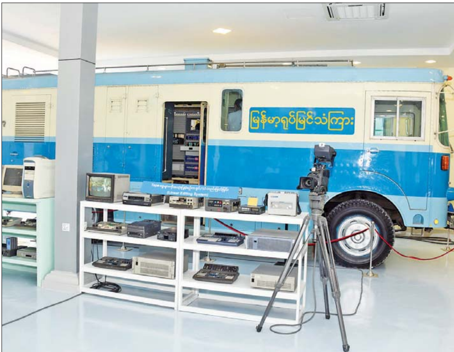
Tape ခွေများကို အသုံးပြုခဲ့စဉ်က ရုပ်/သံ တည်းဖြတ်သည့် စက်များ။