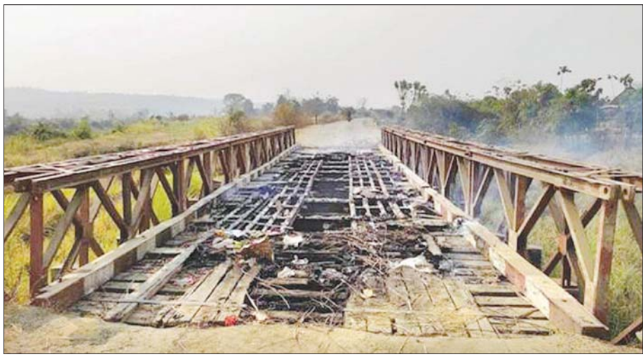
ပြည်သူများလူမှုစီးပွားဘဝအဆင်ပြေစေရန် ဆောက်လုပ်ပေးထားသည့် စစ်ကိုင်းတိုင်းဒေသကြီး ကျွန်းလှ-ကောလင်း ကားလမ်းပေါ်ရှိ ဒေါင်းမြူးချောင်းတံတားကို ယုတ်မာသည့် အကြံဆိုးများဖြင့် အကြမ်းဖက်သမားများက ၂၀၂၁ မတ်လအတွင်းက မီးရှို့ဖျက်ဆီးထားစဉ်။

ပြည်သူ့လူထု၏ လူမှုစီးပွားဘဝများ တိုးတက်ရေး၊ တည်ငြိမ်အေးချမ်းရေး၊ အနာဂတ်နိုင်ငံ ဖွံ့ဖြိုးတိုးတက်ရေးမှာ လူတိုင်း၏မျှော်လင့်ချက်အိပ်မက်များ ဖြစ်ကြပါသည်။ ထိုမျှော်လင့်ချက်အိပ်မက်များ လက်တွေ့အကောင်အထည်ပေါ်လာစေရန်ဆိုပါက ဒီမိုကရေစီအနှစ်သာရများကို ကိုယ်စီကိုယ်စီ လိုက်နာကျင့်သုံးကြခြင်းဖြင့် မျှော်လင့်ချက်အိပ်မက်မှ လက်တွေ့အကျိုးခံစားရမှုသို့ ပြောင်းလဲလာနိုင်ပါကြောင်း တိုက်တွန်းရေးသားလိုက်ရပါသည်။ ။