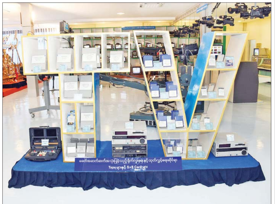
ခေတ်အဆက်ဆက် အသုံးပြုခဲ့သည့် ရိုက်ကူးရေးနှင့် ထုတ်လွှင့်ရေးဆိုင်ရာ Tape များနှင့် S x S Card များ။