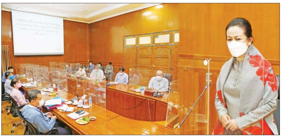
များကို ဆွေးနွေးသည်။ ဆက်လက်၍ အမြဲတမ်းအတွင်းဝန်နှင့် ညွှန်ကြား ရေးမှူးချုပ်များက ညှိနှိုင်းပေါင်းစပ်ဆောင်ရွက်ရန် လိုအပ်ချက်များ၊ အမျိုးသားသဘာဝဘေးအန္တရာယ် များကို ဆွေးနွေးတင်ပြခဲ့ကြောင်း သိရ သည်။ သတင်းစဉ်

ဆက်လက်၍ ဒုတိယဝန်ကြီး ဦးအောင်ထွန်းခိုင် က ပြန်လည်ထူထောင်ရေး၊ ပြန်လည်တည်ဆောက် ရေးနှင့် စပ်လျဉ်း၍ ဆောင်ရွက်မည့် လုပ်ငန်းအစီ အစဉ်များ၊ သက်ဆိုင်ရာလုပ်ငန်းကော်မတီများ၊ ဝန်ကြီးဌာနများ၊ တိုင်းဒေသကြီး/ ပြည်နယ်အစိုးရ အဖွဲ့များနှင့် ပေါင်းစပ်ညှိနှိုင်း ဆောင်ရွက်ရန်ကိစ္စရပ်