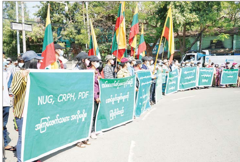
စစ်ကိုင်းတိုင်းဒေသကြီး မုံရွာမြို့၌ နိုင်ငံတော်စီမံအုပ်ချုပ်ရေးကောင်စီနှင့် မြန်မာ့တပ်မတော် ထောက်ခံပွဲ ဆန္ဒမော်ထုတ်ပြုလုပ်ကြစဉ်။

မကွေးတိုင်းဒေသကြီး ပခုက္ကူမြို့ နှင့် ချင်းပြည်နယ် ဟားခါး မြို့တို့၌ လည်းကောင်း၊ မန္တလေးတိုင်းဒေသကြီးအတွင်းရှိ မြို့နယ် ၁၄ မြို့နယ်၌ လည်းကောင်း၊ ပဲခူးတိုင်းဒေသကြီး အတွင်းရှိ မြို့နယ် ၁၂ မြို့နယ်နှင့် ကရင်ပြည်နယ် သံတောင်ကြီး မြို့တို့၌လည်းကောင်း ထောက်ခံပွဲများ ပြုလုပ်ကြပြီး ဆန္ဒမော်ထုတ်ခဲ့ကြသည်။