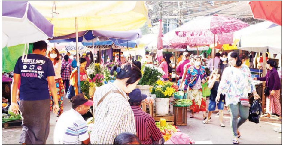
ရန်ကုန်တိုင်းဒေသကြီး တာမွေမြို့နယ်ရှိ စည်ပင်သာယာရေးတစ်စုစု ရောင်းဝယ်ဖောက်ကားသူများနှင့် စည်ကားနေသည်ကို တွေ့ရစဉ်။ နိုင်ငံလင်းအောင်

ရွက်လျက်ရှိကြသည်။ ထို့ပြင် ဈေးများ၊ ဘဏ်များ၊ ဆေးရုံများ၊ လေကြောင်းခရီးစဉ်များ၊ မီးရထား ခရီးစဉ်များ၊ ရေကြောင်းခရီးစဉ် များ၊ မော်တော်ယာဉ်လိုင်းများ ကို တည်ငြိမ်အေးချမ်းစွာဖြင့် ပုံမှန်အတိုင်း ဖွင့်လှစ်ပြေးဆွဲ လျက်ရှိကြောင်း သတင်းရရှိ သည်။ သတင်းစဉ်