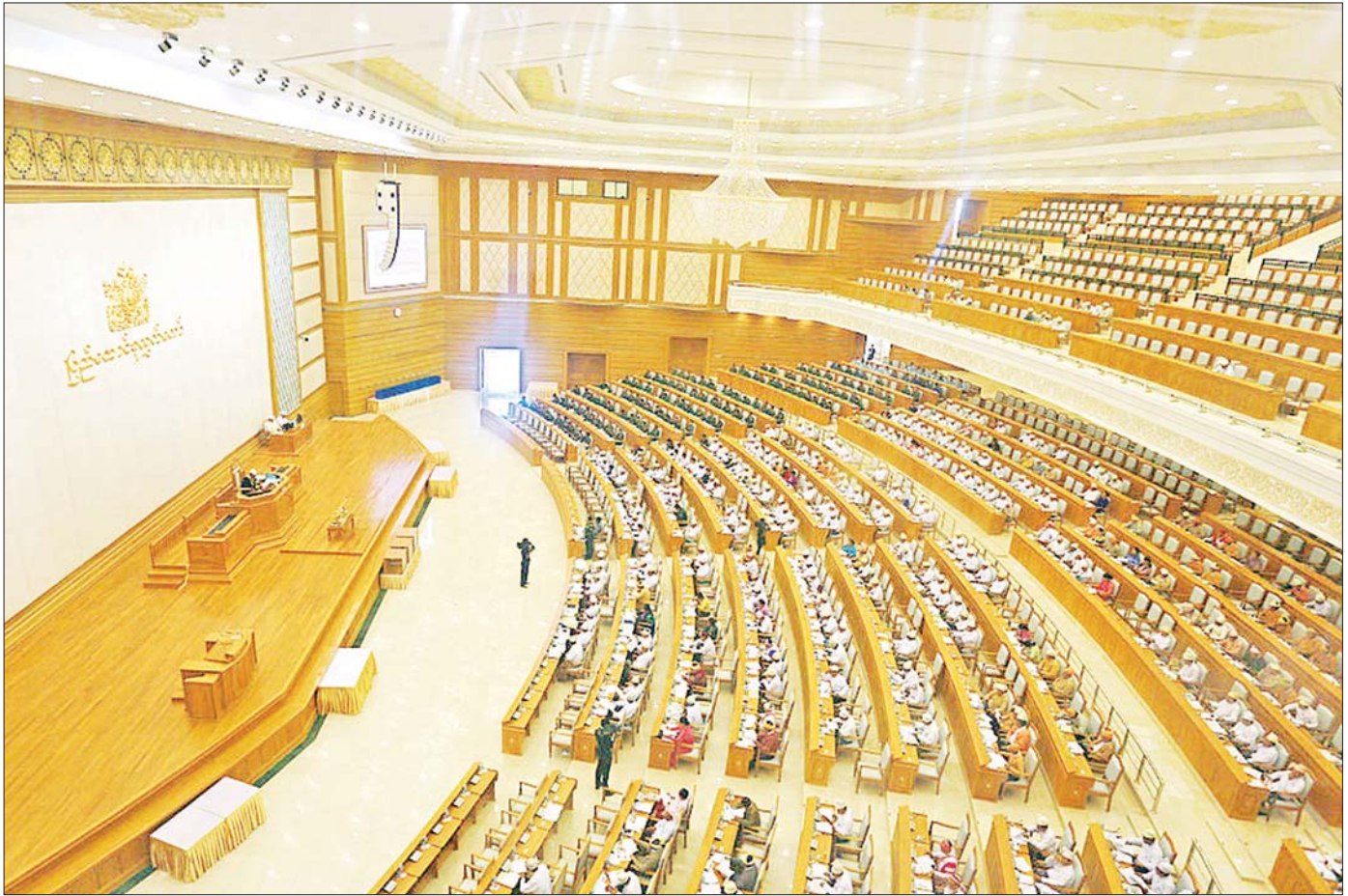
မြန်မာနိုင်ငံ ဒီမိုကရေစီအသွင်ကူးပြောင်းရေး၏လက္ခဏာတစ်ရပ်ဖြစ်သော ပြည်ထောင်စုလွှတ်တော်အစည်းအဝေးကြီး ကျင်းပနေမှုကို တွေ့ရစဉ်။

မိုင်ပေါင်းများစွာသော ခရီးကို ခြေတစ်လှမ်းဖြင့် စတင်သကဲ့သို့ပင် ဖြစ်ပါ၏။ ဒီမိုကရေစီခရီး ပန်းတိုင်ရောက်ရန် လက်တွဲညီညီ ခြေလှမ်းမှန်မှန်ဖြင့် ဆက်၍ လျှောက်လှမ်းနေမှသာ ခရီးပေါက်၍ လိုရာပန်းတိုင်ရောက်ကြမည် ဖြစ်ပါသည်။