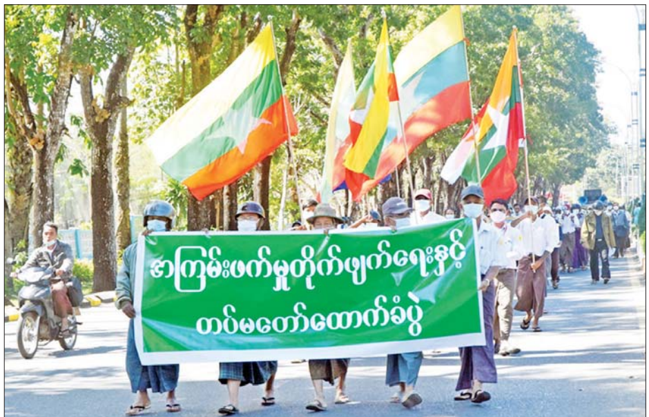
ဧရာဝတီတိုင်းဒေသကြီး၌ နိုင်ငံတော်စီမံအုပ်ချုပ်ရေးကောင်စီနှင့် မြန်မာ့တပ်မတော်ထောက်ခံပွဲ ဆန္ဒမော်ထုတ်ပြုလုပ်ကြစဉ်။

ဒေသကြီး ကျောက်တံတား မြို့နယ်၊ ဒဂုံမြို့နယ်နှင့် စမ်းချောင်း မြို့နယ်တို့၌ လည်းကောင်း၊ ဧရာဝတီတိုင်းဒေသကြီးအတွင်းရှိ မြို့နယ် ၂၆ မြို့နယ်၌ လည်းကောင်း၊ ရခိုင်ပြည်နယ်အတွင်းရှိ မြို့နယ် ရှစ်မြို့နယ်နှင့် ချင်းပြည်နယ် ပလက်ဝမြို့တို့၌လည်းကောင်း၊ စစ်ကိုင်းတိုင်းဒေသကြီး အတွင်းရှိ မြို့နယ် ရှစ်မြို့နယ်၊