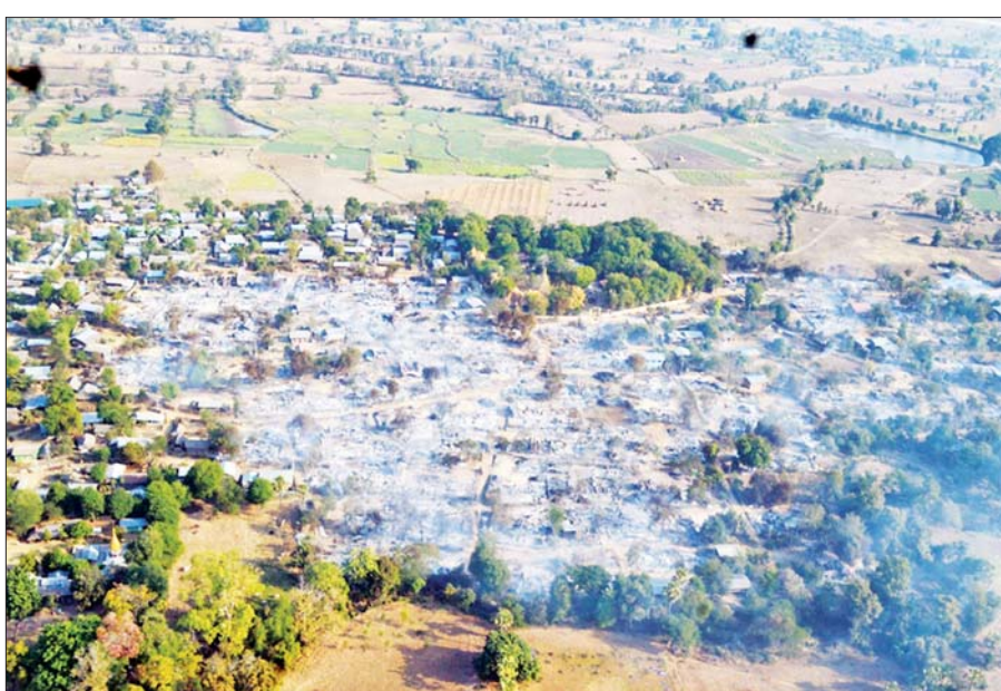
PDF အမည်ခံ အကြမ်းဖက်သမားများ၏ မီးရှို့ဖျက်ဆီးခြင်းခံရသည့် ပုလဲမြို့နယ် အင်မထီးကျေးရွာ။

နေပြည်တော် ဇန်နဝါရီ ၃၁ စစ်ကိုင်းတိုင်းဒေသကြီး ပုလဲမြို့နယ် အင်မထီးကျေးရွာရှိ ပြည်သူ့စစ်(ဌာန) တပ်ဖွဲ့ဝင်များ၏ စခန်းနှင့် ကျေးရွာအနီး တစ်ဝိုက်သို့ ဇန်နဝါရီ ၃၀ ရက် ညနေပိုင်းတွင် PDF အမည်ခံ အကြမ်းဖက်သမားများက ရွာ၏ တောင်ဘက်နှင့် အရှေ့တောင်ဘက်တို့မှ အင်အားအလုံးအရင်းဖြင့် ချဉ်းကပ်လာရာမှ ပြည်သူ့စစ်(ဌာန) တပ်ဖွဲ့ဝင်များနှင့် အပြန်အလှန်ပစ်ခတ်မှုများ ဖြစ်ပွားခဲ့ပြီး အကြမ်းဖက်သမားများက ကျေးရွာနေအိမ်များကို မီးရှို့ဖျက်ဆီးကာ ထွက်ပြေးသွားခဲ့ကြောင်း သိရှိရသည်။