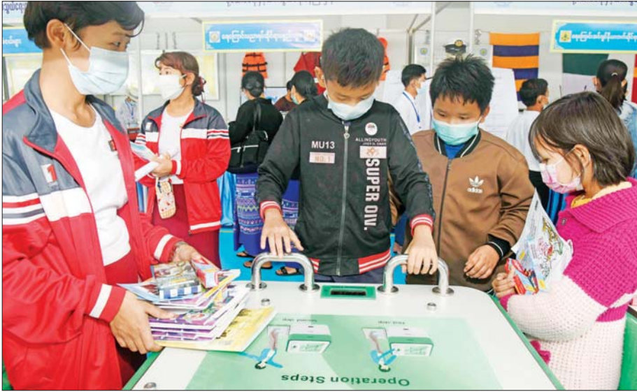
ပညာရေးဝန်ကြီးဌာနပြခန်း၌ ကျောင်းသား ကျောင်းသူများ စိတ်ဝင်တစားလက်တွေ့လေ့လာ။