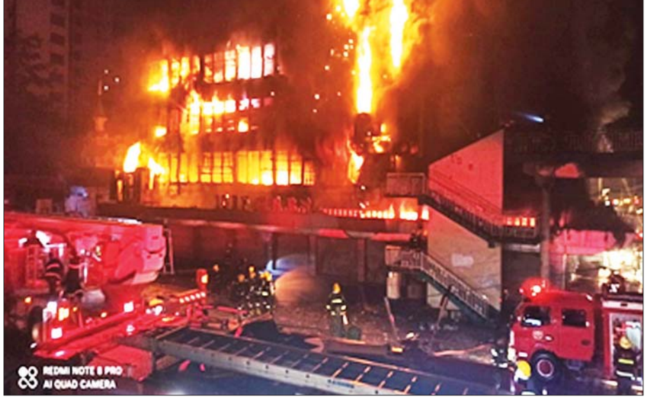
၂၀၂၁ ခုနှစ် ဧပြီ ၁ ရက်က ဒီမိုကရေစီ၏ အနှစ်သာရကို ရုပ်ဆိုးအကျဉ်းတန်စေသည့် အကြမ်းဖက်သမားများ၏ မီးရှို့ဖျက်ဆီးမှုကြောင့် ရန်ကုန်မြို့လယ် ကျောက်တံတားမြို့နယ်ရှိ Ruby Mart ကုန်တိုက် မီးလောင်မှုဖြစ်ပွားနေစဉ်။