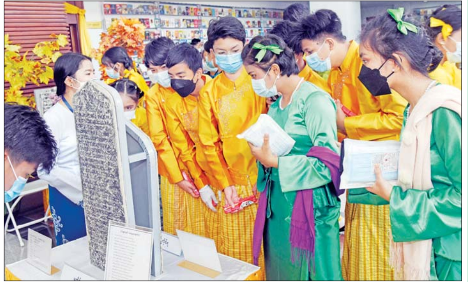
ကျောင်းသား ကျောင်းသူများ ရှေးဟောင်းကျောက်စာ လေ့လာ။