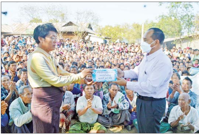
ပုလဲမြို့နယ် အင်မတန်ကျေးရွာရှိဒေသခံပြည်သူများအား တာဝန်ရှိသူများက သွားရောက်ကြည့်ရှုအားပေး၍ ထောက်ပံ့ပစ္စည်းများ ပေးအပ်စဉ်။

ထို့အပြင် ၂၀၂၂ ခုနှစ် ဇန်နဝါရီ ၁၀ ရက်တွင်လည်း ပုလဲမြို့နယ်နှင့် ပတ်ဝန်းကျင်နယ်မြေများအတွင်း အပြစ်မဲ့ပြည်သူများအား ဖမ်းဆီးသတ်ဖြတ်ခြင်း၊ စာသင်ကျောင်းများနှင့် ဆေးရုံ/ဆေးခန်းများအား မီးရှို့ဖျက်ဆီးခြင်း စသည့်အကြမ်းဖက်လုပ်ရပ်များ လုပ်ဆောင်နေသည့် ပကမ အမည်ခံ အကြမ်းဖက်အဖွဲ့ ခေါင်းဆောင် လှဆွေ(ဘ) ဦးဖိုးကျော်ကို အဆိုပါ အင်မတန်ကျေးရွာ၏ အနောက်မြောက်ဘက် မိတာ ၃၀၀၀ ခန့်အကွာရှိ ဦးနောက်ကျေးရွာတွင် ဖမ်းဆီး ရမိခဲ့သည်။