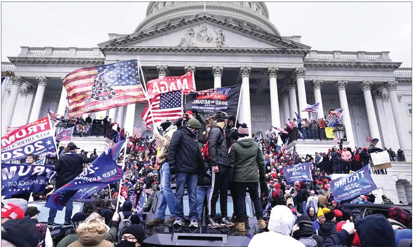
၂၀၂၁ ခုနှစ် ဇန်နဝါရီ ၆ ရက်က ဒီမိုကရေစီ ဘိုးအနိုင်ကြီးဖြစ်သော အမေရိကန်နိုင်ငံ၌ ဒီမိုကရေစီစနစ်ပြိုကွဲတော့မည့်အလားဖြစ်ပေါ်ခဲ့သော အမေရိကန် သမ္မတ ရွေးကောက်ပွဲရလဒ် အငြင်းပွားမှုဖြစ်စဉ်အပေါ် ထရန်နိုကို ထောက်ခံဆန္ဒပြသူများက အမေရိကန်လွှတ်တော်အဆောက်အအုံအား ဝင်ရောက်စီးနင်းမှုကို တွေ့ရစဉ်။

ဒီမိုကရေစီယဉ်ကျေးမှု၏ သဘောသဘာဝ ပြီးတော့ စာအုပ်တစ်အုပ်တွင် ဖတ်ခဲ့ဖူးသည့် လန်ဒန်မြို့က သမိုင်းဝင်ဟိုက်ပတ်ခ် ပန်းခြံ။ ဟိုက်ပတ်ခ်ကော်နာဟု ခေါ်သည့် ပန်းခြံထောင့်တွင် ပိုးဟောချင်၊ ပြောချင် တရားဟောဆရာတို့သည် ထင်ရှားသောစကားလေးများ၊ ခေါက်လှကားကလေးများကို သယ်ယူလာပြီး တစ်နေရာတွင် ခင်းကြသည်။ ပြီးတော့ နားထောင်မည့်သူရှိရှိ မရှိရှိ ထိုစင်မြင့်ကလေးများထက်တွင်ရပ်ပြီး လက်သီးလက်မောင်းတန်းကာ ဟောကြား ပြောကြားလေတော့သည်။ အချို့က ကိုယ့်မကျေနပ်ချက်များကို ဟစ်တိုင်ပမာ ရင်ဖွင့်ပြောရင်း တစ်ခါတစ်ရံ ဟောပြောသူတို့သည် လွန်လွန်ကျွံကျွံ ပြောမှားဆိုမှားတွေ ဖြစ်ခဲ့ကြသည်။ သို့တစေ မနိုးမဝေးရှိ လန်ဒန်ရဲသားကြီးသည် အရေးယူဖို့ဝေးစွာ ပြေးရှောင်နေသည်ဟုဆိုသည်။ စင်မြင့်ပေါ်ကလူသည် သူ၏လွတ်လပ်စွာပြောဆိုခွင့်ကို အပြည့်အဝ အသုံးပြုနေခြင်း ဟူ၍သာ။ ဟိုက်ပတ်ခ်ပန်းခြံက ဟစ်တိုင်အကြောင်း ဖတ်ရင်း ဒီမိုကရေစီစနစ်နှင့် ဒီမိုကရေစီယဉ်ကျေးမှု၏ သဘောသဘာဝကို ကျွန်တော်အတော်သဘော ကျသွားသည်။ သို့ရာတွင် ထိုလွတ်လပ်စွာ ပြောဆိုခွင့်၊ ဟောပြောခွင့်များသည် သတ်မှတ်ထားသည့် နေရာ၊ ဧရိယာတွင်မဟုတ်ဘဲ အများပြည်သူများနှင့် သက်ဆိုင်သည့်နေရာ၊ ဧရိယာ၌ဆိုလျှင်မူ ထိုသူအရေးယူခံရမည့် စည်းကမ်းဥပဒေများလည်းရှိသည်ကိုမူ ထိုစဉ်က ကျွန်တော် မသိခဲ့ရိုး အမှန်ပင်။