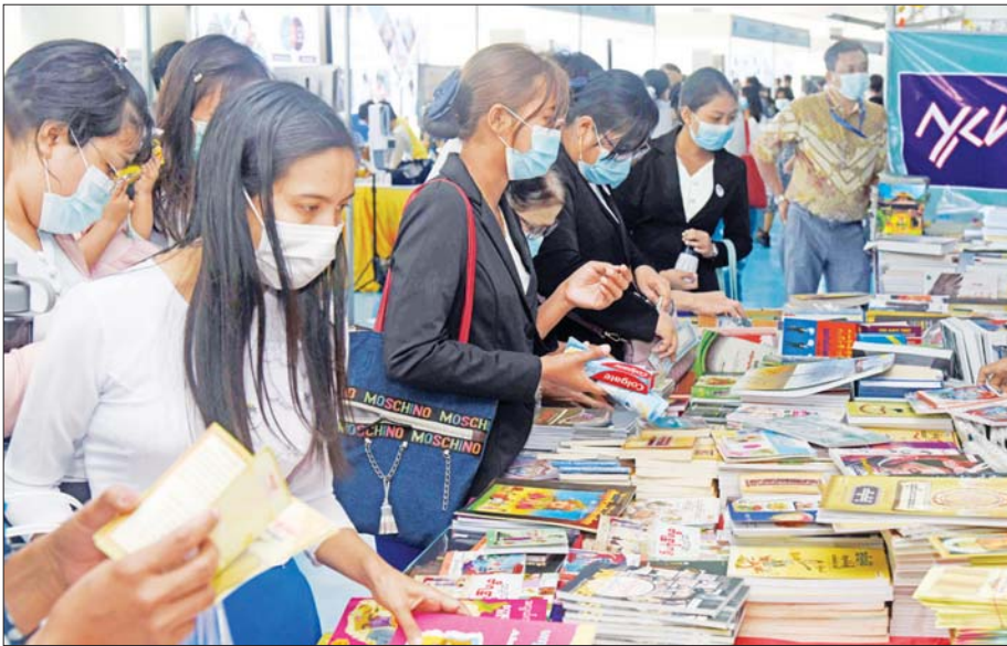
စာအုပ်အရောင်းပြခန်း၌ စာအုပ်များ စိတ်ကြိုက်ဝယ်ယူနေကြသူများအား တွေ့ရစဉ်။