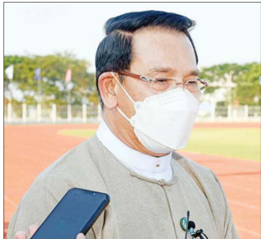
ဦးမောင်မောင်အုန်း (ပြည်ထောင်စု ဝန်ကြီး၊ ပြန်ကြားရေး ဝန်ကြီးဌာန)

အဆိုပါ ပွဲတော်ကြီးတွင် အသိပညာ ဗဟုသုတရဖွယ် ပြခန်းပေါင်း ၄၀ ကျော် ပါဝင်ပြသထားပြီး ဖျော်ဖြေရေးအစီအစဉ်ကောင်းများလည်း ထည့်သွင်းထားရာ စိတ်ပါဝင်စားစွာဖြင့် လာရောက်လေ့လာကြည့် ကျောင်းသား ကျောင်းသူများ၊ လူငယ်များ၊ ပွဲတော်ကြီးတွင် သက်ဆိုင်ရာကဏ္ဍအလိုက် ပါဝင်ဆောင်ရွက်ကြသည့် တာဝန်ရှိသူများနှင့်တွေ့ဆုံ၍ ရင်တွင်းစကားသံများကို ရေးသားဖော်ပြလိုက်ရပါသည်။