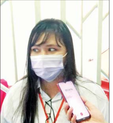
မအိချောချောမြ