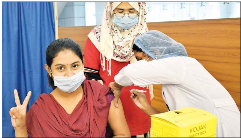
ဘင်္ဂလားဒေ့ရှ်နိုင်ငံတွင် ကိုဗစ်-၁၉ ကာကွယ်ဆေးထိုးပေးနေသည်ကို တွေ့ရစဉ်။

အစိုးရ၏ ကိုဗစ်-၁၉ ကာကွယ်ဆေးထိုး ဆောင်ရွက်ချက်များကြောင့် ကိုဗစ်-၁၉ သေဆုံးနှုန်း သိသိသာသာ ကျဆင်းလာကြောင်း ၎င်းက ပြောသည်။ ဆင်ဟွာ