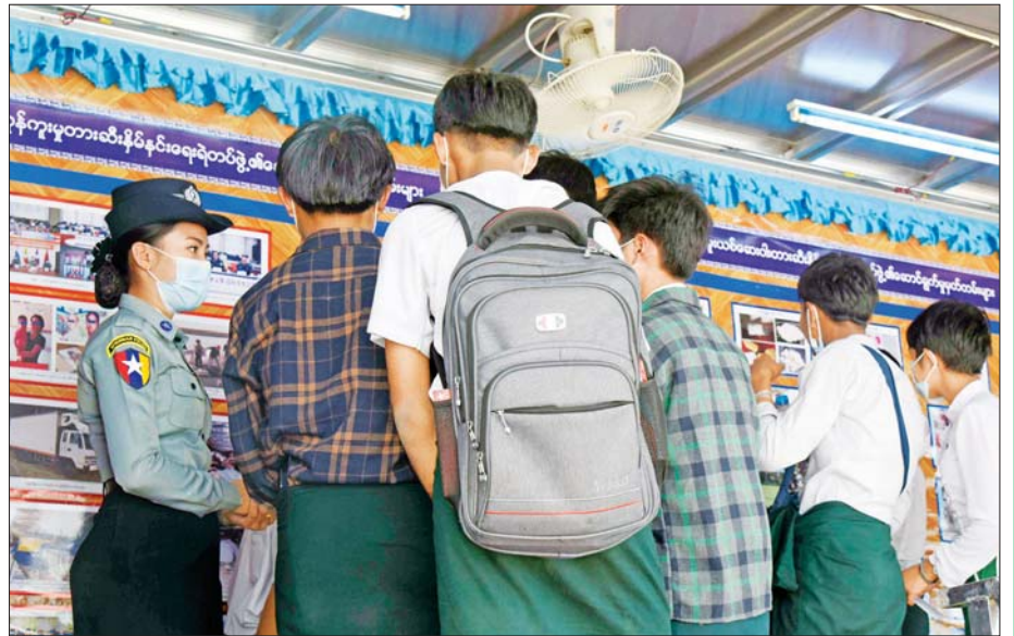
မူးယစ်ဆေးဝါးအသိပညာပေးပြခန်းယာဉ်ပေါ်၌ လေ့လာနေကြသည့် ကျောင်းသား ကျောင်းသူများ။