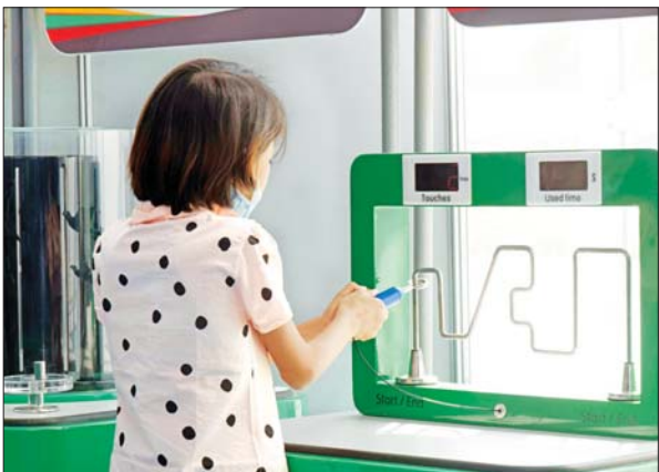
ပညာရေးဝန်ကြီးဌာနပြခန်း၌ ကျောင်းသူတစ်ဦး၏ စိတ်ဝင်တစား လက်တွေ့ပါဝင်ကစားနေစဉ်။