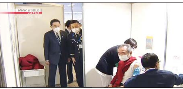
နိုင်ငံတကာရေးရာ စာ - ၁၃

ဂျပန်၌ ဂျပန်ကိုယ်ပိုင်ကာကွယ်ရေးတပ်ဖွဲ့များက အပိုဆောင်း ကိုဗစ်-၁၉ ကာကွယ်ဆေးများထိုးနှံပေး