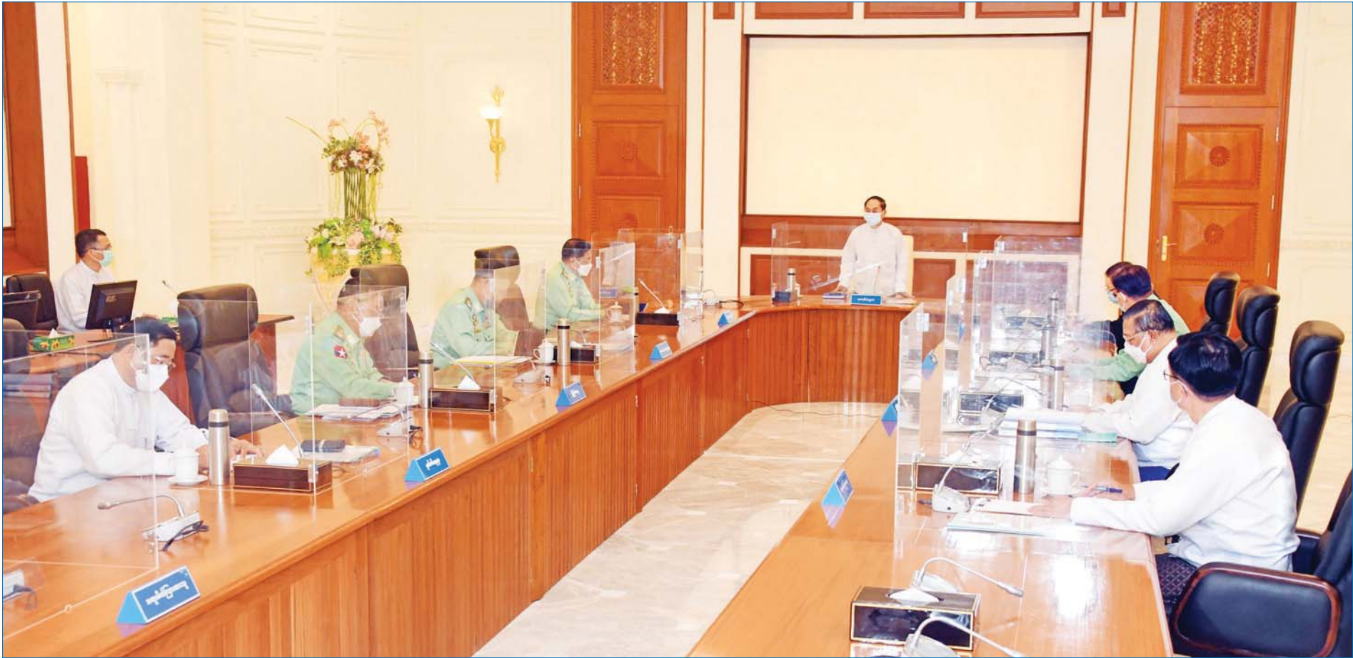
ပြည်ထောင်စုသမ္မတမြန်မာနိုင်ငံတော် အမျိုးသားကာကွယ်ရေးနှင့် လုံခြုံရေးကောင်စီအစည်းအဝေး(၁/၂၀၂၂) ကျင်းပစဉ်။

နေပြည်တော် ဇန်နဝါရီ ၃၁ ပြည်ထောင်စုသမ္မတမြန်မာနိုင်ငံတော် အမျိုးသားကာကွယ်ရေးနှင့် လုံခြုံရေးကောင်စီ အစည်းအဝေး (၁/၂၀၂၂) ကို ယနေ့နံနက်ပိုင်းတွင် နေပြည်တော်ရှိ နိုင်ငံတော်စီမံအုပ်ချုပ်ရေးကောင်စီဥက္ကဋ္ဌရုံး အစည်းအဝေးခန်းမ၌ ကျင်းပပြုလုပ်သည်။ အစည်းအဝေးသို့ ယာယီသမ္မတ ဦးမြင့်ဆွေ၊ ပြည်သူ့လွှတ်တော်ဥက္ကဋ္ဌ ဦးတီခွန်မြတ်၊ တပ်မတော် ကာကွယ်ရေးဦးစီးချုပ် ဗိုလ်ချုပ်မှူးကြီး မင်းအောင်လှိုင်၊ ဒုတိယတပ်မတော်ကာကွယ်ရေးဦးစီးချုပ် ကာကွယ်ရေးဦးစီးချုပ်ကြီး(ကြည်း) ဒုတိယဗိုလ်ချုပ်မှူးကြီး စိုးဝင်း၊ ကာကွယ်ရေးဝန်ကြီးဌာန ပြည်ထောင်စုဝန်ကြီး ဗိုလ်ချုပ်ကြီး မြထွန်းဦး၊ စာမျက်နှာ ၃ ကော်လံ ၁ *