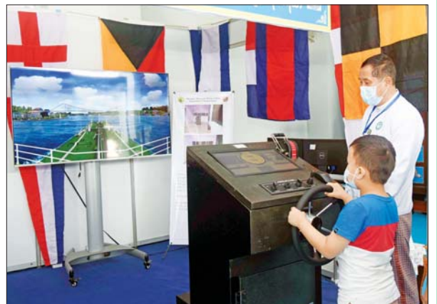
ပို့ဆောင်ရေးနှင့်ဆက်သွယ်ရေးဝန်ကြီးဌာနပြခန်း၌ သင်္ဘော မောင်းနှင်လေ့လာနေသည့် ကလေးငယ်တစ်ဦး။