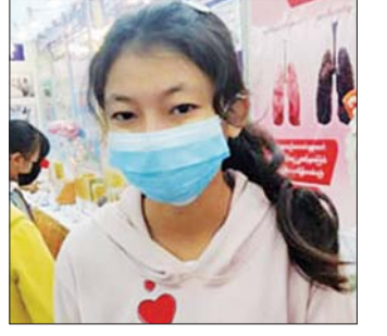
မခင်စန္ဒာပြည့်စုံကျော်

သမီးက လူငယ်နဲ့စာပေပွဲတော်မှာ စာအုပ်အရောင်းဆိုင်တွေနဲ့ ပြခန်းအများကြီးကို လေ့လာခဲ့ပါတယ်။ အဲဒီထဲက သိပ္ပံနဲ့နည်းပညာပြခန်းများကို ပိုပြီး စိတ်ဝင်စားပါတယ်။ ကျောင်းမှာဆို စာတွေပဲ လေ့လာရတာပါ။ အခုပြခန်းတွေက မျက်မြင်တွေ့ရတာ ပိုသဘောကျမိပါတယ်။ ဒါကြောင့်မို့ ပြခန်းတွေအများကြီးရှိတဲ့အထဲက သိပ္ပံနဲ့နည်းပညာပြခန်းတွေကို လေ့လာပါတယ်။ လူငယ်နဲ့စာပေပွဲတော်ဟာ ပြခန်းပေါင်းများစွာနဲ့ စာအုပ်အရောင်းပွဲတော်တွေ ခင်းကျင်းပြသပေးထားတာကို တွေ့ရပါတယ်။ သမီးတို့ ဗဟုသုတရပါတယ်။ သူငယ်ချင်းတွေအများကြီးနဲ့ လာရောက်လေ့လာရတဲ့အတွက် ပျော်ရွှင်မိပါတယ်။ အခုလို ကလေးတွေအတွက် ဗဟုသုတရမယ့် လူငယ်နှင့်စာပေပွဲတော်တွေကို လည်း နှစ်စဉ်နှစ်တိုင်း ကျင်းပပေးစေချင်ပါတယ်။ လာရောက်ကြည့်ရှုခွင့်ရတဲ့အတွက် ကျေးဇူးတင်ပါတယ်။