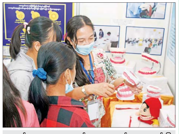
ကျောင်းသူများအား သွားကျန်းမာရေးအတွက် ပညာပေးရှင်းပြ နေစဉ်။