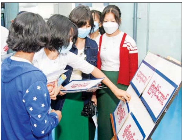
စကားပုံဆက်ပြိုင်ပွဲ၌ ပါဝင်ဆင်နွှဲနေသည့် ကျောင်းသူများ။