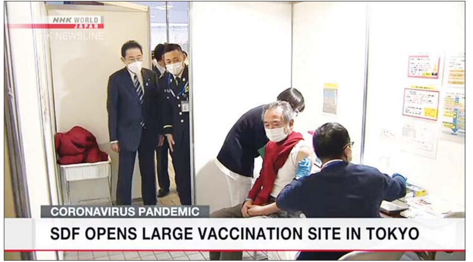
ဂျပန်ကိုယ်ပိုင်ကာကွယ်ရေးတပ်ဖွဲ့များ ကိုဗစ်-၁၉ ကာကွယ်ဆေးထိုးပေးနေစဉ်။