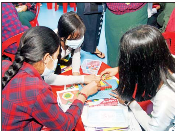
အိမ်ဆောက်ပြိုင်ပွဲ၌ ပါဝင်ဆင်နွှဲနေသည့် ကျောင်းသူများ။