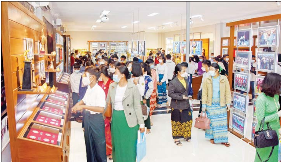
အားကစားနှင့်လူငယ်ရေးရာဝန်ကြီးဌာနပြခန်း၌ ကျောင်းသား ကျောင်းသူများ ပွဲတော်လာပြည်သူများဖြင့် စည်ကားနေစဉ်။

စိတ်ပါဝင်စားစွာ ကြည့်ရှုလေ့လာကြ ထို့ပြင် ကျန်းမာရေးဝန်ကြီးဌာနမှ ဝန်ထမ်းများအနေနှင့်လည်း ပွဲတော်လာပြည်သူများ ကိုဗစ် - ၁၉ ရောဂါကူးစက်မှုမှ ကာကွယ်တားဆီးနိုင်ရန်အတွက် Mask နှင့် Face Shield များဖြန့်ဝေခြင်း၊ အသိပညာ