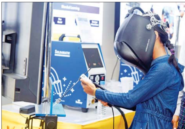
သိပ္ပံနှင့်နည်းပညာပြခန်း၌ ကျောင်းသူတစ်ဦး၏ လက်တွေ့ ဝါရီနံဆော်နည်း ဆောင်ရွက်နေမှု။