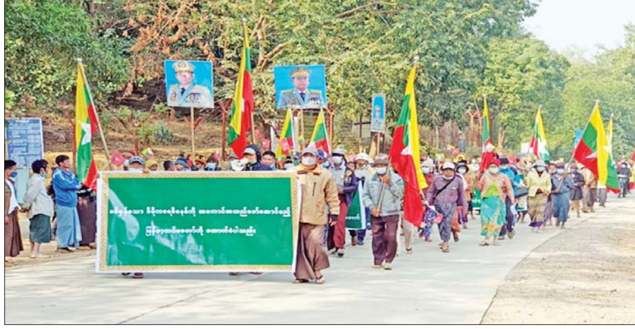
အမ်းမြို့၌ နိုင်ငံတော်စီမံအုပ်ချုပ်ရေးကောင်စီနှင့် မြန်မာ့တပ်မတော်အား ထောက်ခံပွဲပြုလုပ်စဉ်။ မော်လိုက်မြို့တို့၌ လည်းကောင်း၊ မန္တလေးတိုင်းဒေသ ကြီးအတွင်းရှိ မြို့နယ် ၁၆ မြို့နယ်နှင့် မကွေးတိုင်း ဒေသကြီးအတွင်းရှိ မြို့နယ် ငါးမြို့နယ်တို့၌ လည်း ကောင်း ပြုလုပ်ကြပြီး ဆန္ဒမော်ထုတ်ခဲ့ကြသည်။ ထိုသို့ဆန္ဒမော်ထုတ်ရာတွင် “နိုင်ငံတော်စီမံ အုပ်ချုပ်ရေးကောင်စီအား ထောက်ခံပါသည်။ အမျိုး

နေပြည်တော် ဇန်နဝါရီ ၃၁ ၂၀၀၈ ခုနှစ် ဖွဲ့စည်းပုံအခြေခံဥပဒေနှင့်အညီ ဆောင်ရွက်လျက်ရှိသည့် နိုင်ငံတော်စီမံအုပ်ချုပ်ရေး ကောင်စီအား ထောက်ခံပွဲကို ယနေ့တွင် ကချင် ပြည်နယ် မြစ်ကြီးနားမြို့၌ လည်းကောင်း၊ ရှမ်း ပြည်နယ်(မြောက်ပိုင်း) ကွမ်းလုံမြို့နှင့် လောက်ကိုင် မြို့တို့၌ လည်းကောင်း၊ ရှမ်းပြည်နယ်(တောင်ပိုင်း) လွိုင်လင်မြို့နှင့် နမ့်စန်မြို့တို့၌လည်းကောင်း၊ ရှမ်း ပြည်နယ်(အရှေ့ပိုင်း)အတွင်းရှိ မြို့နယ် ငါးမြို့နယ် တို့၌ လည်းကောင်း၊ မွန်ပြည်နယ်အတွင်းရှိ မြို့နယ် ခြောက်မြို့နယ်နှင့် ကရင်ပြည်နယ် လှိုင်းဘွဲမြို့၌ လည်းကောင်း၊ ရန်ကုန်တိုင်းဒေသကြီး မရမ်းကုန်း မြို့နယ်နှင့် ကမာရွတ်မြို့နယ်တို့၌ လည်းကောင်း၊ ဧရာဝတီတိုင်းဒေသကြီး ကျိုက်လတ်မြို့၌ လည်း ကောင်း၊ ရခိုင်ပြည်နယ်အတွင်းရှိ မြို့နယ် ရှစ်မြို့နယ် နှင့် ချင်းပြည်နယ် ပလက်ဝမြို့တို့၌ လည်းကောင်း၊ စစ်ကိုင်းတိုင်းဒေသကြီး မုံရွာမြို့၊ ခန္တီးမြို့နှင့်