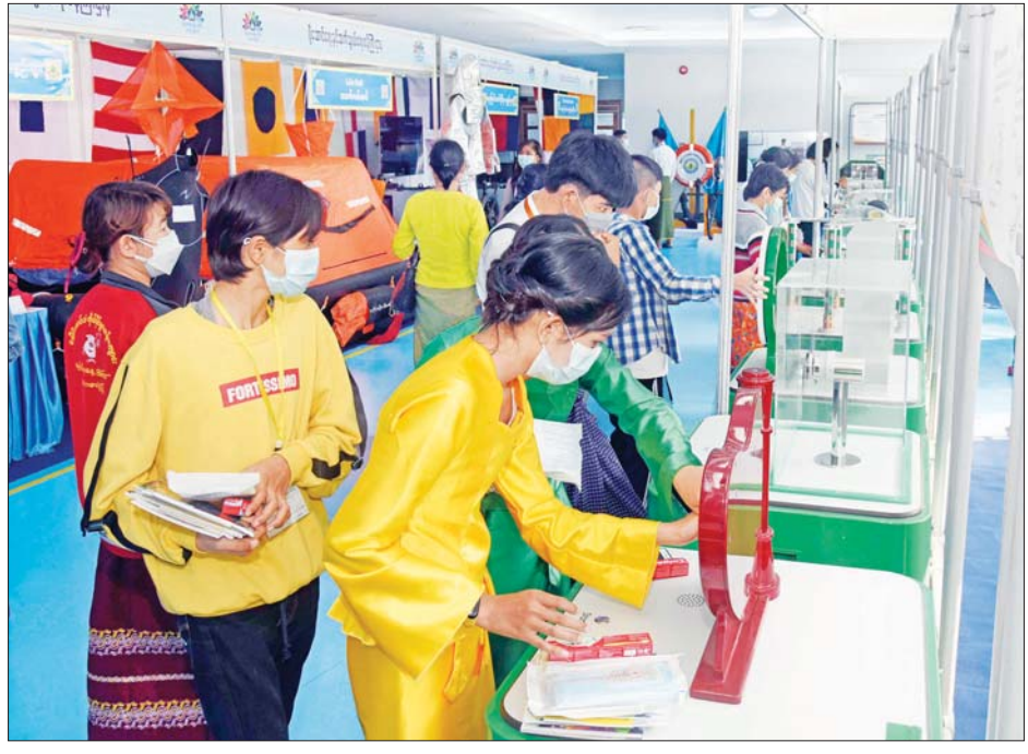
ပညာရေးဝန်ကြီးဌာနပြခန်း၌ ကျောင်းသား ကျောင်းသူများကိုယ်တိုင် ပါဝင်ဆင်နွှဲနေစဉ်။

ဗလင်းတန်မြင့်တင်ပေးနိုင်ရန် ယခုကျင်းပခဲ့သည့်လူငယ်နှင့်စာပေပွဲတော်ကြီးအား ကျောင်းသား၊ ကျောင်းသူများ၊ လူငယ်များ၏ ဉာဏ်ရည် ဉာဏ်သွေးနှင့် အတွေးအခေါ် အယူအဆများ ထက်မြက်လာစေရန်၊ ပွဲတော်၌ ပျော်ရွှင်စွာ ဆင်နွှဲရင်း စုပေါင်းအလုပ်များတွင် ဝိုင်းဝန်းပါဝင် တတ်သည့် အလေ့အထကောင်းများရရှိလာစေရန်၊ လူငယ်များ၏ တီထွင်ဖန်တီးလိုစိတ် ရင့်သန်လာစေရန်နှင့် စာပေဖတ်ရှုလေ့လာလိုစိတ်မြှင့်မားလာစေရန်၊ အသိပညာ၊ အတတ်ပညာနှင့် ကျင့်ဝတ်တန်ဖိုး အပါအဝင် ကာယ၊ ဉာဏ၊ စာရိတ္တ၊ မိတ္တ၊ ဘောဂဗလင်းတန် မြှင့်တင်ပေးနိုင်ရန်နှင့် အနာဂတ်လူ့ဘောင်အဖွဲ့အစည်းအား ၎င်းတို့၏ အတွေးအမြင်ကောင်းများဖြင့် တည်ဆောက်အကောင်အထည်ဖော်နိုင်ရန် စသည့် ရည်ရွယ်ချက်ကောင်းများဖြင့် နိုင်ငံတော်အစိုးရက ကျင်းပပေးခဲ့ခြင်းဖြစ်သည်။ သတင်း - မျိုးဆက်သစ်