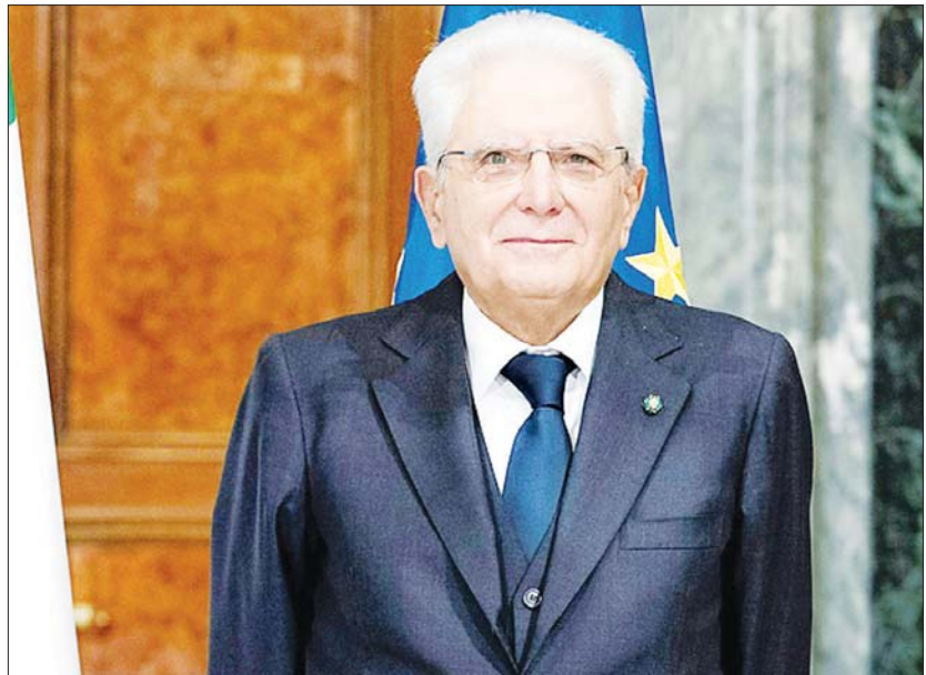
အီတလီသမ္မတ ဆာဂျီယိုမတ်တာရယ်လာ။