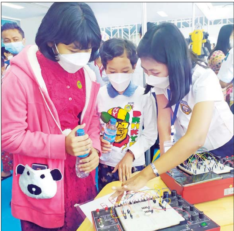
သိပ္ပံနှင့် နည်းပညာပြခန်း၌ ကျောင်းသား ကျောင်းသူများ ကိုယ်တိုင်လက်တွေ့ စမ်းသပ်လေ့လာနေစဉ်။