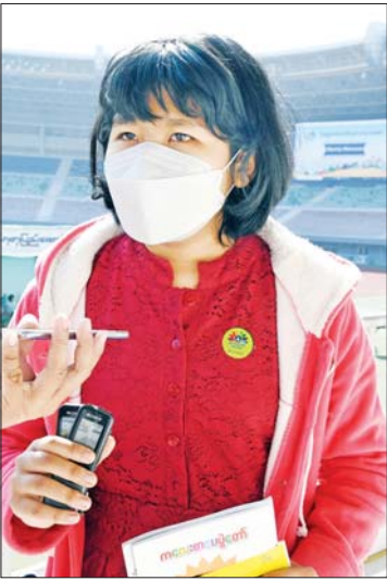
မအိမ့်မှူးကျော်သူ