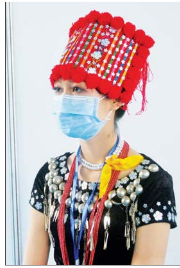
မမိုးပြည့်ပြည့်နိုင်