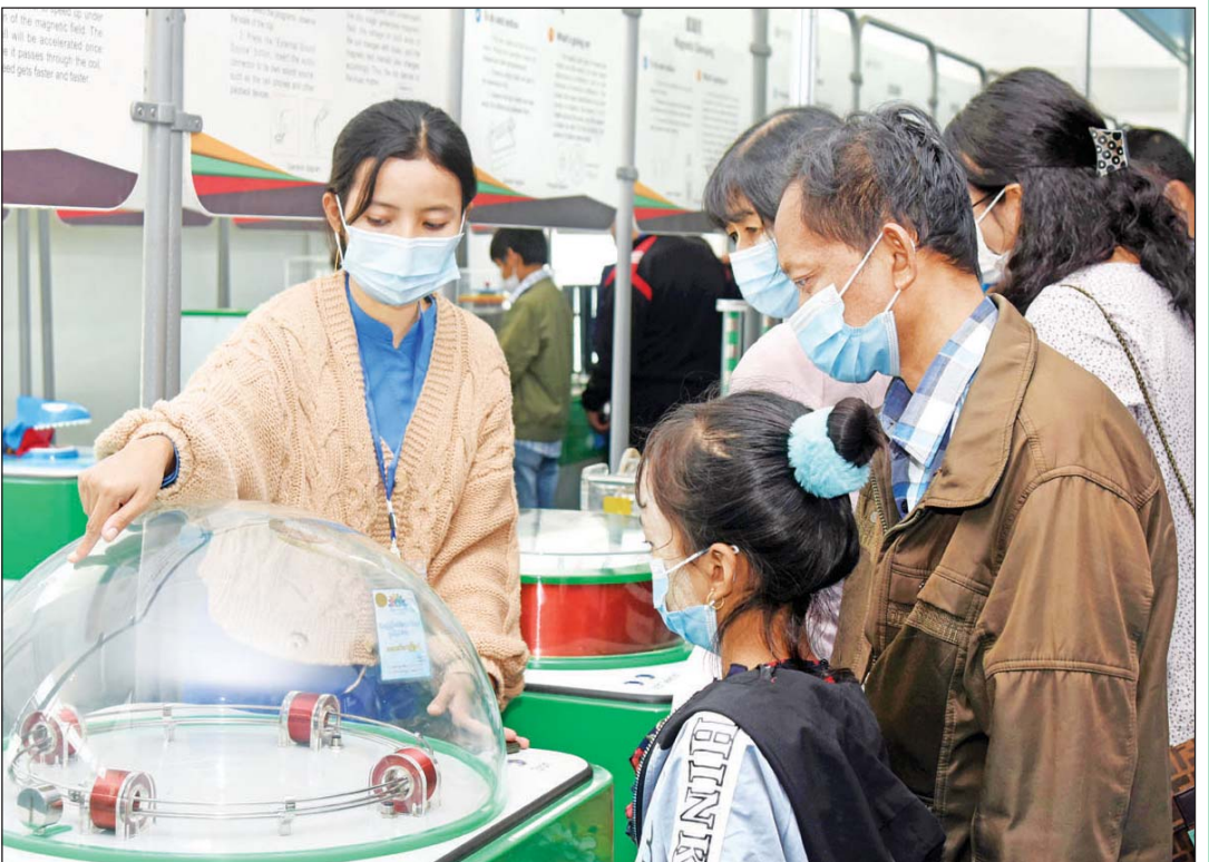
ပညာရေးပြခန်း၌ ဖျော်ရွှင်ဖွယ်ကိန်းများဖြင့် လူငယ်များ စိတ်ဝင်တစား ပါဝင်ကစားကြစဉ်။