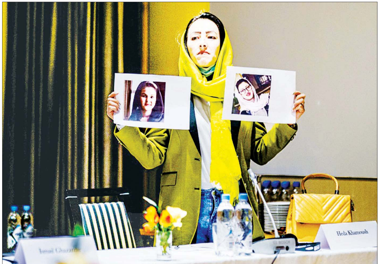
ဖမ်းဆီးခံထားရသည့် အာဖဂန်အမျိုးသမီးတက်ကြွလှုပ်ရှားသူများ၏ ဓာတ်ပုံကိုပြသနေသည်ကို တွေ့ရစဉ်။

အဆိုပါအမျိုးသမီးသည် ၎င်း၏မိသားစုအတွက် အစားအစာ