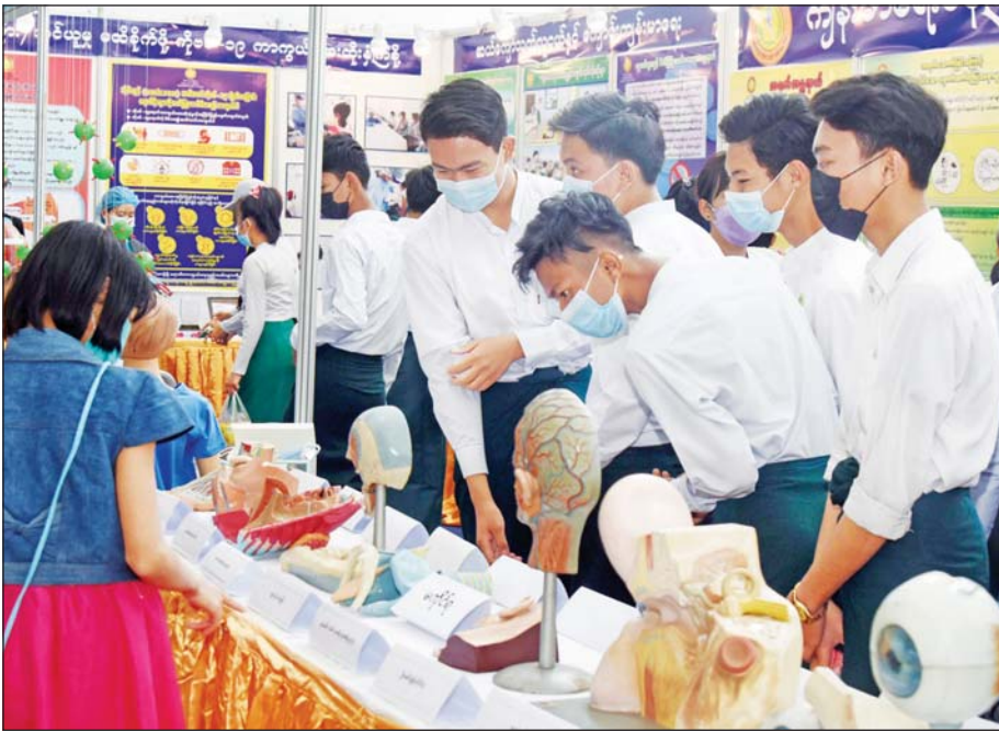
ကျန်းမာရေးပြခန်း၌ လူ့ခန္ဓာကိုယ်ဖွဲ့စည်းပုံအကြောင်းကို ကျောင်းသား ကျောင်းသူများ စိတ်ဝင်တစား လေ့လာနေစဉ်။