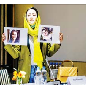
စာမျက်နှာ - ၁၄

အာဖဂန်နစ္စတန်၌ အမျိုးသမီးများ အခွင့်အရေးအတွက် အာမခံချက်ပေးရန် ကုလအကြီးအကဲတောင်းဆို