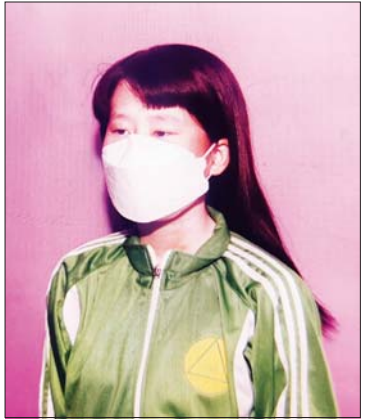
မအင်ကြင်းဖူး