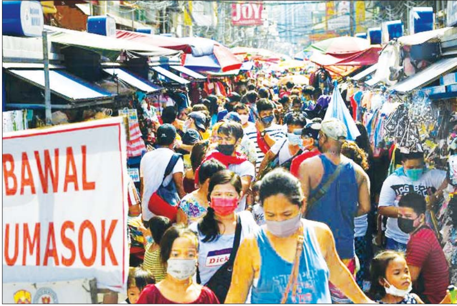
မန်လာမြို့၌ ဈေးဝယ်များနှင့် စည်ကားနေသည်ကို တွေ့ရစဉ်။

ယခုအခါ ခရီးသွားလုပ်ငန်းမှာ ပြန်လည်နာလန် ထူလာပြီး အလုပ်အကိုင်အခွင့်အလမ်းများ ဖန်တီး ပေးနိုင်ကာ တိုင်းပြည်စီးပွားရေး တိုးတက်ရေး အတွက် အထောက်အကူဖြစ်မည်ဟု သမ္မတ ပြောရေးဆိုခွင့်ရှိသူ ကာလိုနိုဂရလက်စ်က ပြော သည်။