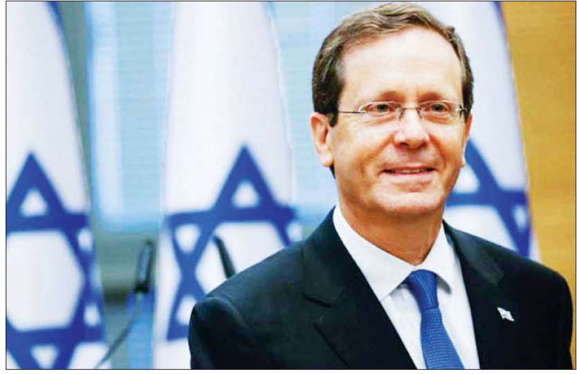
အစ္စရေးသမ္မတ အိုင်ဇက်ဟားဇော့။

ယူအေအီးနိုင်ငံသို့ သွားရောက်ခဲ့သည်။ ဆင်ဟွာ