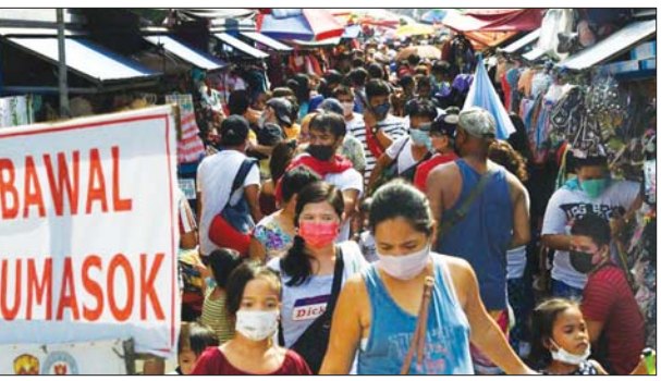
ဖိလစ်ပိုင်နိုင်ငံသို့ ကာကွယ်ဆေးထိုးထားသည့် နိုင်ငံခြား ခရီးသွားများ လာရောက်ခွင့်ပြုမည် စာမျက်နှာ - ၁၃

အာဖဂန်နစ္စတန်၌ အမျိုးသမီးများ အခွင့်အရေးအတွက် အာမခံချက်ပေးရန် ကုလအကြီးအကဲတောင်းဆို