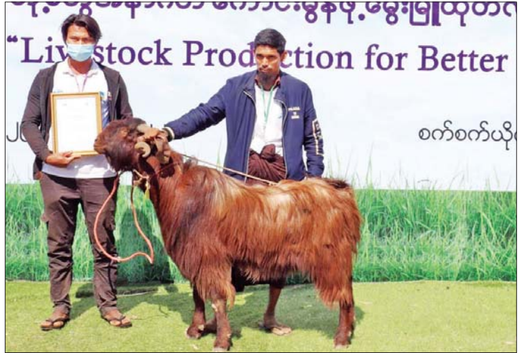
ဆုရ ဆိတ်နှင့် မွေးမြူသည့်ပိုင်ရှင်။

ကျေးလက်နေပြည်သူများအနေဖြင့် ကျွဲ၊ နွားများကို မိရိုးဖလာ သဘောတရားအတိုင်း ရွေးရိုးစဉ်ဆက် မွေးမြူကြပြီး အချိန်တန်အရွယ်ရောက်ပါက ဈေးကွက်ထဲ ထုတ်ရောင်းလိုက်ကာ ရသမျှငွေလေးဖြင့် တင်းတိမ်နေကြဆဲ ဖြစ်သော်လည်း စီးပွားဖြစ်လုပ်ကိုင်နိုင်သည့် လုပ်ငန်းကြီးတစ်ခုဖြစ်သည့် အားလျော်စွာ မွေးမြူသည့်စနစ်၊ မွေးမြူသည့်မျိုးများ၊ ကျွေးမွေးသည့်အစာအစဉ်များ ပြောင်းလဲရန် လိုအပ်လျက်ရှိနေ