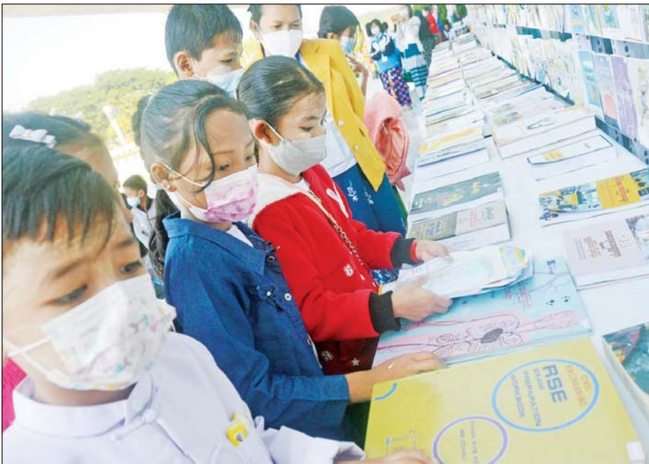
ပြန်ကြားရေးပြခန်း၌ ကလေးငယ်များ စာအုပ်စာပေများကို စိတ်ဝင်တစား ဖတ်ရှုစဉ်။