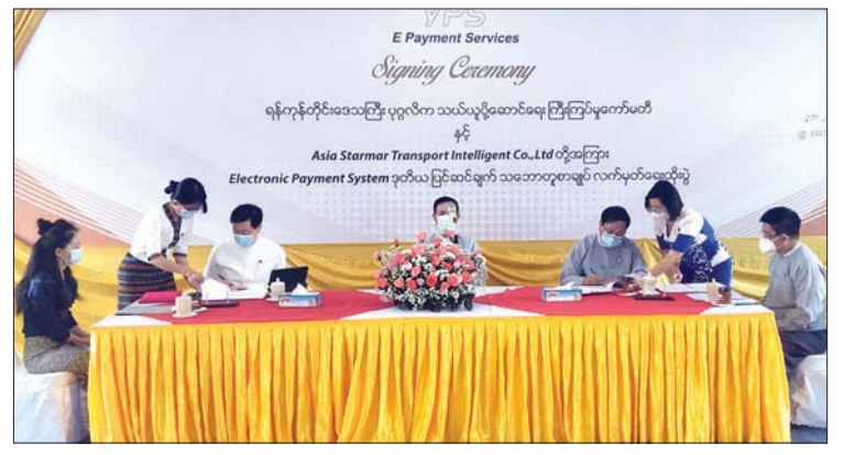
ဝိုင်ဘီအက်စ်ယာဉ်များတွင် EPS ကတ်စနစ် အရှိန်မြှင့်ဆောင်ရွက်နိုင်ရေး YRTC နှင့် လုပ်ငန်းရှင်အကြား သဘောတူလက်မှတ်ရေးထိုးစဉ်။

ယာဉ်လိုင်းပေါင်း ၃၆ လိုင်းမှ ယာဉ်အစီးရေပေါင်း ၁၉၀၄ စီးတွင် ပြန်လည်လည်ပတ် အသုံးပြုလျက်ရှိသည်။ ပြည်သူများအကြား ငွေပေးချေ ကတ်ဖြန့်ချိထားမှုအနေဖြင့် ကတ်ပေါင်း တစ်သိန်းဝန်းကျင် ဖြန့်ဖြူးထားပြီးဖြစ်ရာ ကတ်ပေါင်း ခုနစ်သောင်းနီးပါးတွင် ငွေဖြည့်သွင်းမှုပြုလုပ်ကာ အသက်ဝင်လျက်ရှိသည်။ ဝိုင်ဘီအက်စ်ယာဉ်များပေါ်တွင် နေ့စဉ်စီးနင်းလိုက်ပါ အသုံးပြုနေသော ပြည်သူများမှာ ကတ်သုံးသောင်းကျော်အထိ အသုံးပြုလျက်ရှိသည်။ ယခုလတ်တလောတွင် ကတ်အသစ်အသုံးပြုမည့် ပြည်သူများအား ယခင်ကဲ့သို့ ငွေဖြည့်ကတ်တစ်ကတ်ကို ငွေကျပ်နှစ်ထောင်ဖြင့် ရောင်းချမည်မဟုတ်ဘဲ