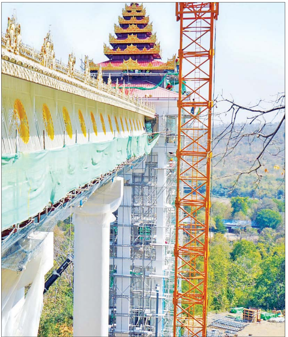
မန်းရွှေစက်တော်ဘုရားတွင် တည်ဆောက်နေသည့် ဓာတ်လှေကားတာဝါ ပြီးစီးမှုကို တွေ့ရစဉ်။