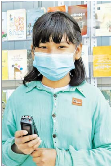
မခင်စုခိုင်