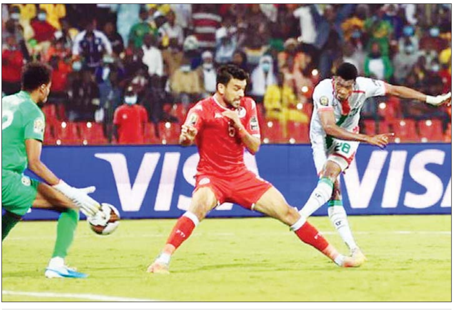
ဘာကီနာဖာဆိုအသင်းမှ ကွာတာရာ တူနီးရှားအသင်းဘက်သို့ ဂိုးသွင်းယူရန် ကြိုးပမ်းစဉ်။

အာဖဂန်နိုင်ငံများ ဖလားပြိုင်ပွဲ တို့ပွဲစဉ်ကို ဇန်နဝါရီ ၃၀ ရက် -ဂိုးမရှိဖြင့် အနိုင်ရရှိပြီး ဆီမီး ၁၆ သင်းအဆင့်တွင် နာမည် ကွာတားဖိုင်နယ်ပွဲစဉ်မှ ဘာကီနာ နံနက်ပိုင်းက ယှဉ်ပြိုင်ကစားခဲ့ရာ ဖိုင်နယ်သို့ တက်လှမ်းသွားပြီ ကြီး ဂါဘွန်အသင်းကို ပယ်နယ်တီ အဆုံးအဖြတ်၌ အနိုင်ရရှိကာ ကွာတားဖိုင်နယ်သို့ တက်လှမ်း လာနိုင်ခဲ့သော ဘာကီနာဖာဆို အသင်းသည် ယခုပွဲစဉ်တွင် ပြိုင်ဘက် တူနီးရှားအသင်းကို ခက်ခက်ခဲခဲ ယှဉ်ပြိုင်ကစားခဲ့ရပြီး ပထမပိုင်း ပွဲချိန်ပြည့်ခါနီးတွင် ရရှိခဲ့သော ကွာတာရာ၏ တစ်လုံး တည်းသော သွင်းဂိုးဖြင့် အနိုင်ရရှိ ကာ ဆီမီးဖိုင်နယ်သို့ တက်လှမ်း နိုင်ခဲ့ခြင်း ဖြစ်သည်။ ကွာတားဖိုင်နယ် ပွဲစဉ်ဖြစ် သည့်အတွက် နှစ်သင်းစလုံးကစား သမား အစုံအလင်ဖြင့်ပွဲထွက်လာ ပြီး ပွဲမှာ အပြန်အလှန် ထိုးဖောက် မှုများဖြင့် အကြိတ်အနယ်ရှိကာ ပြိုင်ဆိုင်မှုပြင်းထန်ခဲ့သည်။ ဘာကီ နာဖာဆိုအသင်းသည် ယခုပွဲစဉ်တွင် စာမျက်နှာ ၁၈ ကော်လံ ၅ ◻