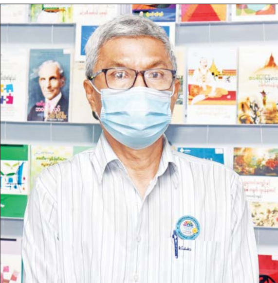
ဦးရဲတင့် (ဒုတိယ ဝန်ကြီး ပြန်ကြားရေး ဝန်ကြီးဌာန)

များများက ပြခန်းတိုင်းကို စိတ်ဝင်စားကြတယ်။ ပညာရေးပြခန်းမှာလည်း စက်ပစ္စည်းကိရိယာတွေရှိတယ်။ သိပ္ပံနဲ့ နည်းပညာပြခန်းကိုလည်း အများစိတ်ဝင်စားကြတယ်။ လေကြောင်း၊ ရေကြောင်းပြခန်းတွေကိုလည်း စိတ်ဝင်စားကြတယ်။ ပြခန်းတွေအားလုံးကို စည်စည်ကားကားနဲ့ ဝိုင်းဝန်းပြီး ကြည့်ရှုကြတာ တွေ့ပါတယ်။ အလားတူပဲ ဖျော်ဖြေတဲ့နေရာမှာလည်း အားပေးကြ