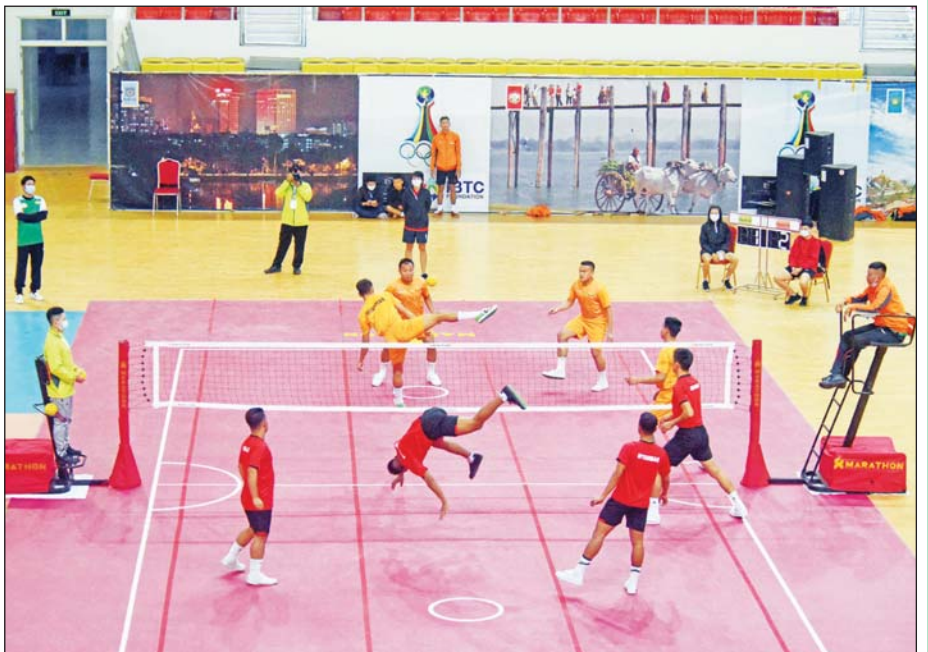
(၃၁)ကြိမ်မြောက် အရှေ့တောင်အာရှ အားကစားပြိုင်ပွဲသို့ ဝင်ရောက်ယှဉ်ပြိုင်ကြမည့် ပိုက်ကျော်ခြင်း အားကစားသမားများ သရုပ်ပြလေ့ကျင့်နေစဉ်။