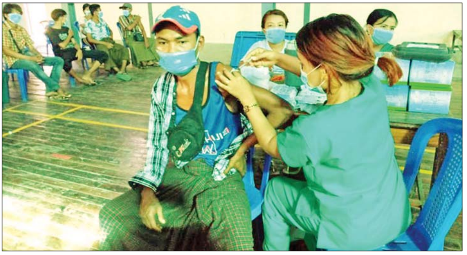
အတွင်းရှိ မြို့နယ် ၂၆ မြို့နယ်တို့၌ ကျောင်းသား ကျောင်းသူ ၂၉၅ ဦး တို့ကို တပ်မတော်မှ ဆေးအဖွဲ့များ က ပြည်သူ့ဆေးရုံများမှ ဆရာဝန် များ၊ သက်ဆိုင်ရာ ကျန်းမာရေး ဝန်ထမ်းများ၊ စေတနာ့ဝန်ထမ်း များနှင့် ပူးပေါင်း၍ ကိုဗစ်- ၁၉ ရောဂါ ကာကွယ်ဆေးထိုးနှံပေး သည်။ လိုအပ်သည်များ ဆောင်ရွက်ပေး ထိုသို့ ဆောင်ရွက်ပေးနေမှု ရရှိသည်။ သတင်းစဉ်

ဒေသခံပြည်သူ ၁၃၁၅ ဦး၊ မန္တလေး တိုင်းဒေသကြီးအတွင်းရှိ ခရိုင် ခုနစ်ခုမှ ဒေသခံပြည်သူ ၇၇၄၂ ဦး တို့ကို တပ်မတော်မှ ဆေးအဖွဲ့များ က ပြည်သူ့ဆေးရုံများမှ ဆရာဝန် များ၊ သက်ဆိုင်ရာ ကျန်းမာရေး ဝန်ထမ်းများ၊ စေတနာ့ဝန်ထမ်း များနှင့် ပူးပေါင်း၍ ကိုဗစ်-၁၉ ရောဂါ ကာကွယ်ဆေး ထိုးနှံပေး သည်။ (ယာဝုံ) ထို့အတူ ကျောင်းသား ကျောင်းသူများကိုလည်း ကိုဗစ်- ၁၉ ရောဂါ ကာကွယ်ဆေးများ ထိုးနှံပေးလျက်ရှိရာ ဇန်နဝါရီ ၂၉ ရက်နှင့် ယနေ့တွင် ရှမ်း ပြည်နယ် (မြောက်ပိုင်း) နောင်ချို မြို့နယ်၌ ကျောင်းသား ကျောင်း သူ ၂၉ ဦး၊ ဧရာဝတီတိုင်းဒေသကြီး