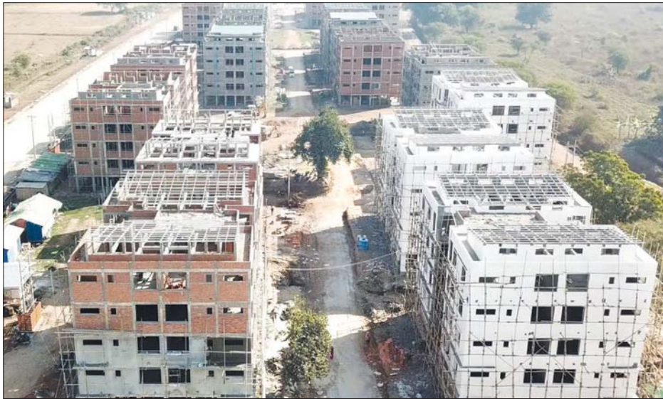
၈၀ ရာခိုင်နှုန်းဆောက်လုပ်ပြီးစီးနေသည့် မင်္ဂလာရန်ကင်း ပြည်သူ့အငှားအိမ်ရာစီမံကိန်းမှ အဆောက်အအုံများ။