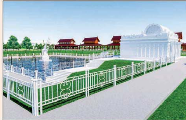
မုစလိန္နုအိုင်

၁။ နိုင်ငံတော်စီမံအုပ်ချုပ်ရေးကောင်စီဥက္ကဋ္ဌ၊ တပ်မတော်ကာကွယ်ရေးဦးစီးချုပ် ဗိုလ်ချုပ်မှူးကြီးမင်းအောင်လှိုင် ဦးဆောင်သည့် (၇)ရက်သား၊ သမီး၊ ဘုရားဒါယကာ၊ ဒါယိကာမတို့က မာရဝိဇယပုဒ္ဓရုပ်ပွားတော်မြတ်ကြီးအား မြန်မာနိုင်ငံတွင် ထေရဝါဒပုဒ္ဓသာသနာတော်ထွန်းလင်းတောက်ပလျက်ရှိသည်ကို ကမ္ဘာကိုပြသရန်၊ တိုင်းပြည်အေးချမ်းသာယာမှုရှိစေရန်၊ ရုပ်ပွားတော်မြတ်ကြီးအား ပြည်တွင်း၊ ပြည်ပဘုရားဖူးများလာရောက်ခြင်းဖြင့် ဒေသတိုးတက်စည်ကားမှုကို အထောက်အကူဖြစ်စေရန်၊ နိုင်ငံတော်ဖွံ့ဖြိုးတိုးတက်မှုအား အထောက်အကူဖြစ်စေရန် ရည်သန်လျက် ပြည်ထောင်စုနယ်မြေ နေပြည်တော်၊ ဒက္ခိဏသီရိမြို့နယ်အတွင်း၌ သာသနာတော်ထုံး၊ ရုပ်ပွားဆင်းတုတော်ထုံး၊ မြန်မာ့ရိုးရာတည်ထုံးများနှင့်အညီ တည်ဆောက်ပူဇော်လျက် ရှိပါသည်။