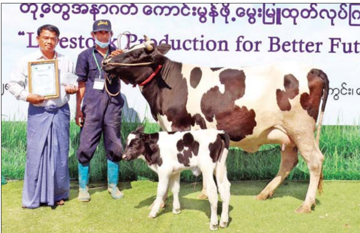
ဆုရ နို့စားနွားနှင့် မွေးမြူသည့်ပိုင်ရှင်။