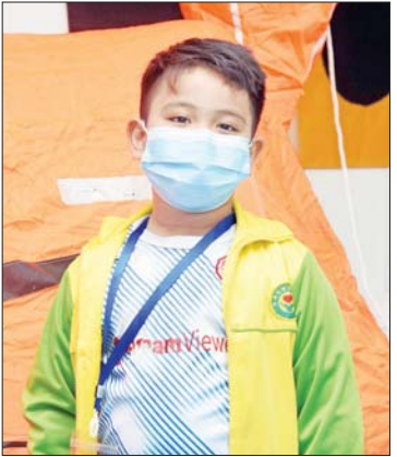
မောင်ထက်လျှံရဲရင့်