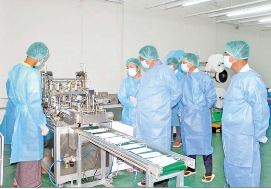
ပြည်ထောင်စုဝန်ကြီး ဒေါက်တာချာလီသန်း အမှတ်(၉)အထည်စက်ရုံခွဲ (အင်းစိန်)၌ ပါးစပ်နှင့် နှာခေါင်း စည်း ထုတ်လုပ်နေမှုကို ကြည့်ရှုစစ်ဆေးစဉ်။

ထို့နောက် ပြည်ထောင်စုဝန်ကြီးသည် စက်မှု ဝန်ကြီးဌာနနှင့် Korea Apparel Testing and Research Institute (KATRI) တို့ ပူးပေါင်း၍ မြန်မာ နိုင်ငံ၏ အထည်အလိပ်၊ အဝတ်အထည်ဆိုင်ရာ စက်မှုဖွံ့ဖြိုးတိုးတက်ရေးအတွက် Joint Venture (JV) အဖြစ် ဖက်စပ်အကျိုးတူပူးပေါင်း၍ နိုင်ငံတကာ အဆင့်မီ အထည်အလိပ်နှင့် အဝတ်အထည် စမ်းသပ် ခြင်း၊ စစ်ဆေးခြင်းနှင့် အရည်အသွေး ထောက်ခံချက် လက်မှတ်ထုတ်ပေးခြင်းတို့ကို ဆောင်ရွက်မည့် ချည်မျှင်နှင့်အထည် ထုတ်လုပ်မှု နည်းပညာဖွံ့ဖြိုးရေး ဌာနသို့ ရောက်ရှိပြီး ဓာတ်ခွဲခန်းအဆောက်အအုံ တည်ဆောက်ပြီးစီးမှုနှင့် အထည်အလိပ်နှင့် ပတ်သက်၍ စမ်းသပ်စစ်ဆေးမည့် စက်ကိရိယာများ ရောက်ရှိမှုတို့ကို ကြည့်ရှုစစ်ဆေးပြီး စစ်ဆေးမည့် နည်းစဉ်အဆင့်ဆင့်ကို ရေးဆွဲသတ်မှတ်ထားရန်နှင့် နိုင်ငံတကာအဆင့်မီ စစ်ဆေးစမ်းသပ်နိုင်ရေး အတွက် ဝန်ထမ်းများကို ကြိုတင်လေ့ကျင့်သင်ကြား ပေးရန်နှင့် လုပ်ငန်းခွင်အတွင်း ပတ်ဝန်းကျင်ကောင်း ဖြစ်အောင် စီမံဆောင်ရွက်ပေးရန် မှာကြားသည်။ ယင်းနောက် ပြည်ထောင်စုဝန်ကြီးသည် အမှတ်