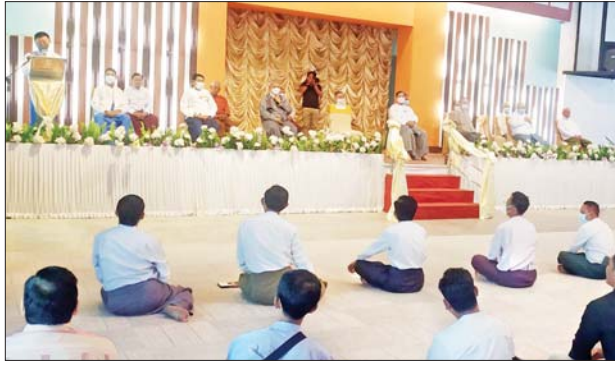
ခြင်းလုံးပညာရှင်ကြီးများအား ကန်တော့ပွဲတွင် မြန်မာနိုင်ငံ ရိုးရာ ခြင်းလုံးအဖွဲ့ချုပ်ဥက္ကဋ္ဌ ဦးသက်လွင် အမှာစကား ပြောကြားစဉ်။