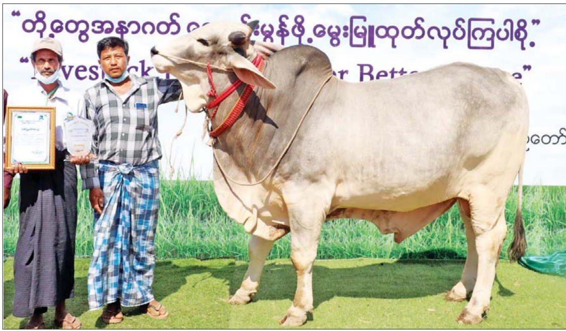
အသားတိုးနှားထီး ပထမဆုရ နွားနှင့် မွေးမြူသည့်ပိုင်ရှင်။

တိရစ္ဆာန်ပြိုင်ပွဲများတွင် ခိုင်းနှားနှင့်ပတ်သက်သော အမှတ်ပေးစည်းမျဉ်းများ၊ နို့စားနွားနှင့်ပတ်သက်သော အမှတ်ပေးစည်းမျဉ်းများ၊ အသားတိုးနှားနှင့်ပတ်သက်သော အမှတ်ပေးစည်းမျဉ်းများ၊ သိုး၊ ဆိတ်နှင့် ပတ်သက်သော အမှတ်ပေး စည်းမျဉ်းများကိုရေးဆွဲပြီး ပြိုင်ပွဲအလိုက် အချို့က ထုတ်လုပ်မှု၊ အချို့က