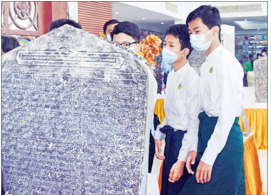
ဘာသာသုံးမျိုးဖြင့် ရေးထိုးထားသည့် ရှေးဟောင်းကျောက်စာများကို လူငယ်များ စိတ်ဝင်တစား ကြည့်ရှုလေ့လာကြစဉ်။