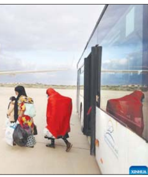
မစ်ဆူရာတာမြို့ လေဆိပ်တွင် နေရပ်ပြန်မည့် ရွှေ့ပြောင်းနေထိုင်သူ များကို တွေ့ရစဉ်။

၂၀၂၁ ခုနှစ်အတွင်း တရား မဝင် ရွှေ့ပြောင်းနေထိုင်သူ ၃၂၄၂၅ ဦးကို ကယ်တင်နိုင်ခဲ့ပြီး လစ်ဗျား နိုင်ငံသို့ ပြန်လည်ပို့ဆောင်ပေး နိုင်ခဲ့သည်။ လစ်ဗျားကမ်းရိုးတန်း တွင် သေဆုံးခဲ့သော တရားမဝင် ဆင်ဟွာ