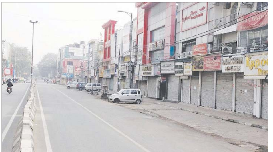
နယူးဒေလီမြို့တွင် ကိုဗစ်-၁၉ စည်းကမ်းတင်းကျပ်မှုအရ ဈေးဆိုင်များပိတ်ထားသည်ကို တွေ့ရစဉ်။

လက်ရှိထုတ်ပြန်ထားသည့် စည်းကမ်းချက်များ မှာ ဇန်နဝါရီ ၈ ရက်ကတည်းက ထုတ်ပြန်ခဲ့ခြင်းဖြစ် သည်။ လွန်ခဲ့သည့်နှစ် နှစ်ကုန်ပိုင်းတွင် အိန္ဒိယ မြို့ပြ ဒေသများ၌ ကိုဗစ်-၁၉ကူးစက်မှုများပြားလာ သည့်အတွက် စည်းကမ်းချက်များ တင်းကျပ်ခဲ့ခြင်း ဖြစ်သည်။ ဇန်နဝါရီလနှောင်းပိုင်းမှစတင်ကာ နယူး ဒေလီတွင် နေ့စဉ်ကူးစက်မှုများမှာ တဖြည်းဖြည်း ကျဆင်းလာခဲ့သည်။ ဆေးရုံများတွင် ကိုဗစ် - ၁၉ လူနာများ တက်ရောက်ကုသမှုနှုန်းမှာ ၂၀ ရာခိုင် နှုန်းအောက်တွင်ရှိသည်။ သို့သော်လည်း အိန္ဒိယနိုင်ငံ