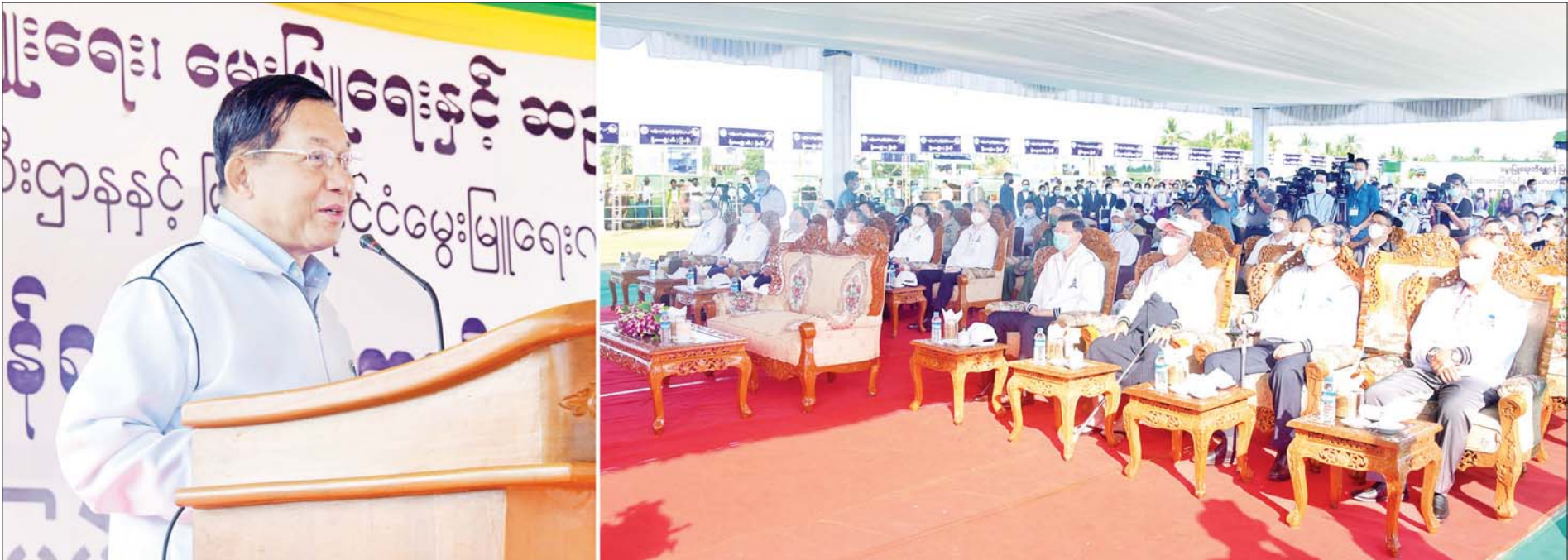
နိုင်ငံတော်စီမံအုပ်ချုပ်ရေးကောင်စီဥက္ကဋ္ဌ နိုင်ငံတော်ဝန်ကြီးချုပ် ဗိုလ်ချုပ်မှူးကြီး မင်းအောင်လှိုင် (၇၅)နှစ်မြောက် စိန်ရတုပြည်ထောင်စုနေ့အထိမ်းအမှတ် ၂၀၂၂ ခုနှစ် မွေးမြူရေးတိရစ္ဆာန်ပြပွဲ၊ ဖြိုင်ပွဲ ဖွင့်ပွဲအခမ်းအနားတွင် အမှာစကားပြောကြားစဉ်။