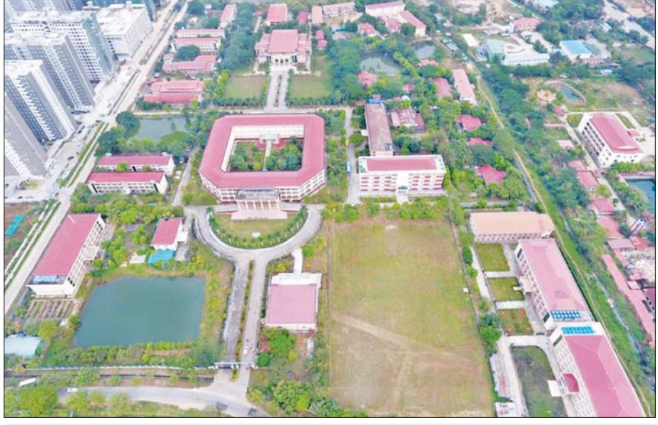
ပြည်ထောင်စုတိုင်းရင်းသားလူငယ်များစွမ်းရည်ဖွံ့ဖြိုးရေးဒီဂရီကောလိပ်(ရန်ကုန်)

ဦးစီးဌာနသည် တိုင်းရင်းသားလူမျိုးများ၏ လူ့စွမ်းအားအရင်းအမြစ်များ ဖွံ့ဖြိုးတိုးတက်ရေး လုပ်ငန်းများကို အားသွန်ခွန်စိုက်ဆောင်ရွက်နေပြီး တစ်ဆက်တည်းမှာပင် နယ်စပ်ရေးရာဝန်ကြီးဌာန၏ မျှော်မှန်းချက်များနှင့် လုပ်ငန်းစဉ်များကို အောင်မြင်စွာအကောင်အထည်ဖော် ဆောင်လျက် ရှိသည်။ ထို့ကြောင့် ပညာရေးနှင့် လေ့ကျင့်ရေး ဦးစီးဌာနကို “ပြည်ထောင်စုပန်းများ ဝေဆာ ပွင့်လန်းစေသော ဘူမိနက်သန်မြေ” ဟု ရည်ညွှန်း ခေါ်ဆိုလိုက်ရပေသည်။