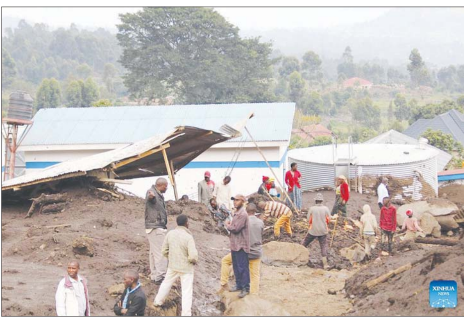
ကီဆိုရိုခရိုင်တွင် ရေကြီးလွှမ်းမိုးမှုဒဏ်ခံစားရသည့် မြင်ကွင်းကို တွေ့ရစဉ်။

ကမ်ပါလာ ဇန်နဝါရီ ၂၈ ယူဂန္ဒာနိုင်ငံ အနောက်ပိုင်းခရိုင် ကီဆိုရိုရှိ ခရိုင်ခွဲသုံးခုတွင် လူ ပေါင်း ၈၀၀ ကျော်မှာ မိုးအဆက် မပြတ်ရွာသွန်းမှု၊ ရေကြီးမှုနှင့် ရွှံ့နှံ့များပြားမှုတို့ကြောင့် ကြုံတွေ့ ခံစားခဲ့ရကြောင်း နိုင်ငံကယ်ဆယ် ရေးအေဂျင်စီက ဇန်နဝါရီ ၂၇ ရက် တွင် ပြောသည်။