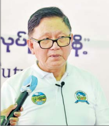
ဒေါက်တာအောင်ကြီး (ဒုတိယဝန်ကြီး)

အစာ အထူးသဖြင့် မြက်စိုက်ပျိုးမှု ပြသ တယ်။ နောက်တစ်ခါ မြက်ကနေ ပြုပြင် ပြီးတော့ မြက်ချဉ်ဖတ်၊ ပြောင်းချဉ်ဖတ် လုပ်တဲ့ ပြခန်းတွေ ပြသတယ်။ အခုလက်ရှိ တိရစ္ဆာန်အစာနဲ့ပတ်သက် တဲ့ အစာထုတ်လုပ်တဲ့ ပြခန်းတွေ၊ အစာ ရောင်းချ ကုမ္ပဏီတွေရဲ့ ပြခန်းတွေအပြင် တစ်ဖက်ကလည်း တိရစ္ဆာန်တွေရဲ့ ကာကွယ်ဆေး၊ ကုသဆေး၊ ဆေးဝါးတွေနဲ့ ပတ်သက်ပြီး ပြသတဲ့ ပြခန်းတွေလည်း ပါဝင်ပါတယ်။ ဒီနေရာမှာ တစ်ခုကောင်း တာက အစိုးရဌာနဆိုင်ရာ ပြခန်းတွေတင် မဟုတ်ဘဲနဲ့ ပုဂ္ဂလိကဌာနဆိုင်ရာ ပြခန်း တွေပါ ပြသတဲ့အတွက် လာရောက်ပြီး ကြည့်ရှုတဲ့ ပြည်သူတွေအတွက် အားလုံး ဟာ ဗဟုသုတကို တစ်နေရာတည်းမှာ ပြည့်ပြည့်စုံစုံ ပြသသွားနိုင်အောင် စီစဉ် ခင်းကျင်းပြသထားတာ ဖြစ်ပါတယ်။ နေပြည်တော်နဲ့ အနီးတစ်ဝိုက်မှာရှိတဲ့ တောင်သူတွေ၊ မွေးမြူရေးသမားတွေနဲ့ စိုက်ပျိုးရေးသမားတွေပါ စိုက်ပျိုးရေး၊ မွေးမြူရေးနှင့်ဆိုင်ရာ ဝန်ကြီးဌာနက ပြုလုပ်ကျင်းပတဲ့ မွေးမြူရေးနှင့် တိရစ္ဆာန် ပြပွဲ၊ ပြိုင်ပွဲကို လာရောက်ကြည့်ရှုပါ အားပေးပါ။ တစ်ဖက်ကလည်း ဒီကနေ