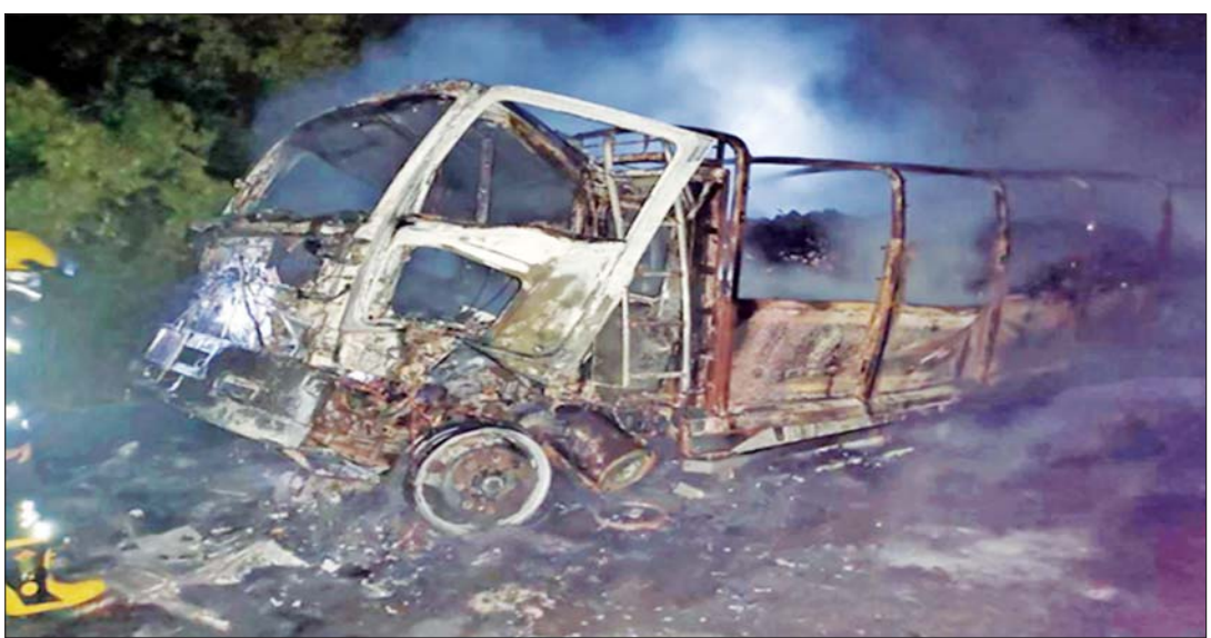
ကော့ကရိတ်မြို့နယ်၌ အကြမ်းဖက်သမားများက ခြောက်ဘီးကုန်တင်ယာဉ်တစ်စီးကို မီးရှို့ဖျက်ဆီးခဲ့မှု မှတ်တမ်းဓာတ်ပုံ။

နေပြည်တော် ဇန်နဝါရီ ၂၈ ကရင်ပြည်နယ် ကော့ကရိတ်မြို့နယ်၌ အကြမ်းဖက်သမားများက ခြောက်ဘီးကုန်တင်ယာဉ်တစ်စီးကို မီးရှို့ဖျက်ဆီးခဲ့ကြောင်း သိရသည်။ ဖြစ်စဉ်မှာ ဇန်နဝါရီ ၂၇ ရက်ည ၉ နာရီ ၁၀ မိနစ်ခန့်က ကရင်ပြည်နယ် ကော့ကရိတ်မြို့နယ် ကော့ကရိတ်-မြဝတီ ကားလမ်း၌ မော်တော်ယာဉ်တစ်စီး မီးလောင်နေကြောင်း သတင်းအရ လုံခြုံရေးတပ်ဖွဲ့ဝင်များနှင့် မီးသတ်တပ်ဖွဲ့ဝင်များ ပါဝင်သော ပူးပေါင်းအဖွဲ့က