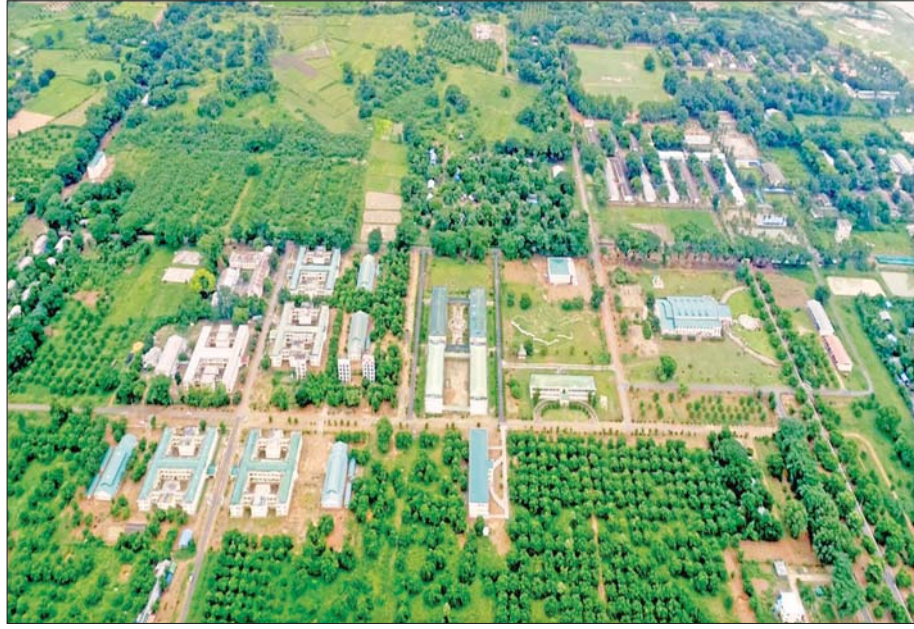
ပြည်ထောင်စုတိုင်းရင်းသားလူမျိုးများဖွံ့ဖြိုးရေးတက္ကသိုလ်

နယ်စပ်ရေးရာဝန်ကြီးဌာနသည် နယ်စပ်ဒေသ နှင့် တိုင်းရင်းသားလူမျိုးများ ဖွံ့ဖြိုးတိုးတက်ရေး ဦးစီးဌာနနှင့် ပညာရေးနှင့်လေ့ကျင့်ရေးဦးစီးဌာန ဟူ၍ အဓိကဦးစီးဌာနကြီးနှစ်ခုဖြင့် ဖွဲ့စည်းထား သည်။ ဝန်ကြီးဌာန၏ ဦးတည်ချက် ၈ ရပ်မှ တစ်ခု ဖြစ်သည့် နယ်စပ်ဒေသမှ တိုင်းရင်းသားလူငယ် များအား အခြေခံ၊ အဆင့်မြင့်နှင့် အသက်မွေးဝမ်း