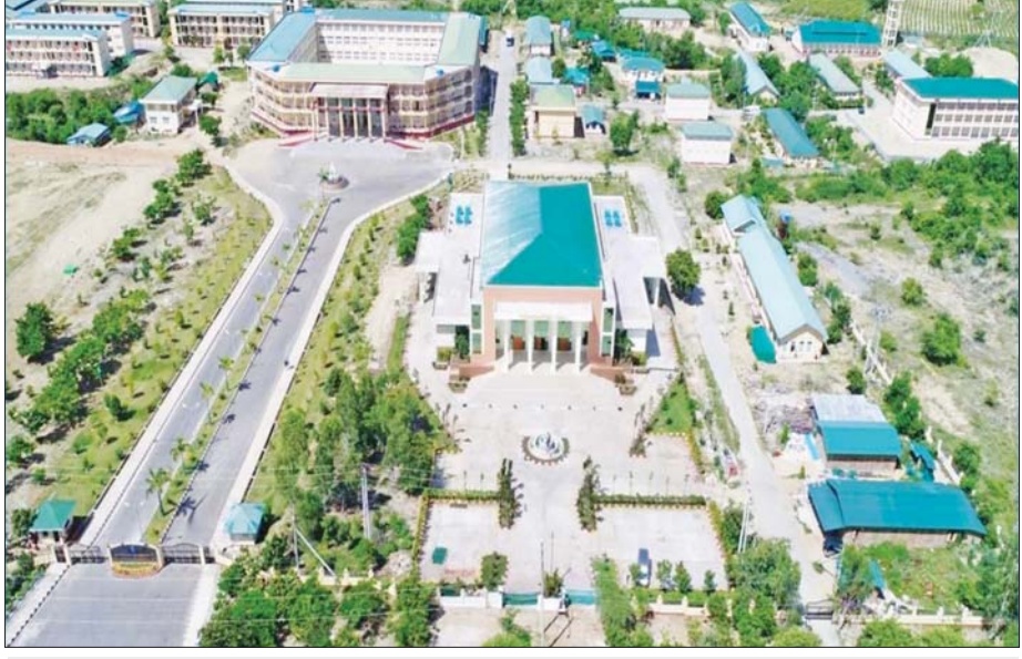
ပြည်ထောင်စုတိုင်းရင်းသားလူငယ်များစွမ်းရည်ဖွံ့ဖြိုးရေးဒီဂရီကောလိပ်(စစ်ကိုင်း)