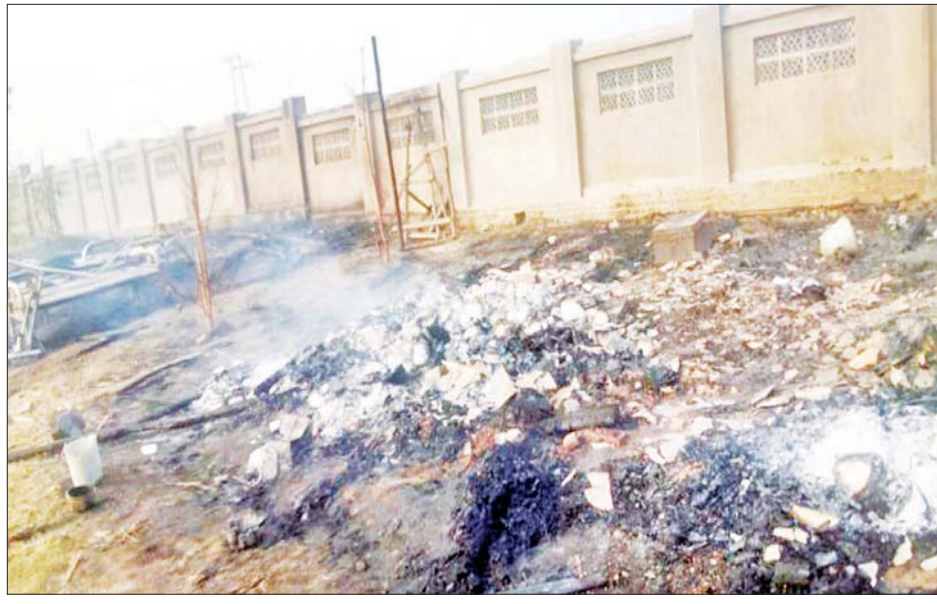
ယင်းမာပင်မြို့နယ်ရှိ သီတဂူချင်းတွင်း သာမဏေကျော်ဗုဒ္ဓတက္ကသိုလ်အား PDF အမည်ခံအကြမ်းဖက် သမားများက လက်လုပ်စိန်ပြောင်းများ၊ မီးတုတ်များဖြင့် အကြောင်းမဲ့ လာရောက်ပစ်ခတ်တိုက်ခိုက် မီးရှို့ ဖျက်ဆီးမှု မှတ်တမ်းဓာတ်ပုံများ။