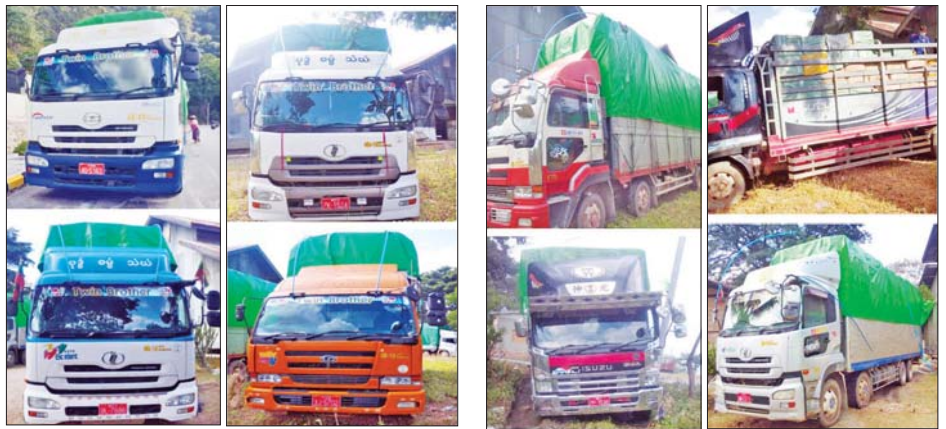
၁၇-၁-၂၀၂၂ ရက်တွင် ပင်းတယမြို့နယ် ကျုံးရဲကင်းစခန်းပူးပေါင်းအဖွဲ့မှ လွှဲပြောင်းအပ်နှံခဲ့သော မော်တော်ယာဉ်ရှစ်စီးနှင့်ပတ်သက်၍ ယာဉ်နှင့်ယာဉ်ပေါ်ပါ ကုန်ပစ္စည်းများကို အသေးစိတ်စစ်ဆေးဆောင်ရွက်ခဲ့ပြီး ၂၆-၁-၂၀၂၂ ရက်တွင် တင်ပြလာသည့် အမှုတွဲ စုစုပေါင်း ၂၄ မှု စုစုပေါင်း ခန့်မှန်းတန်ဖိုးကျပ် ၈၄၇၆၀၅၀၀ ခန့်၏ မှတ်တမ်းဓာတ်ပုံ။

စီမံခန့်ခွဲမှုဖြင့် ပင်းတယမြို့နယ် ကျုံးရဲကင်းစခန်း ပူးပေါင်းအဖွဲ့မှ လွှဲပြောင်းအပ်နှံခဲ့သော မော်တော်ယာဉ်ရှစ်စီးနှင့်ပတ်သက်၍ ယာဉ်နှင့်ယာဉ်ပေါ်ပါ ကုန်ပစ္စည်းများအား စစ်ဆေးဆောင်ရွက်ခဲ့ရာ လူသုံးကုန်ပစ္စည်းမျိုးစုံ ခန့်မှန်းတန်ဖိုးငွေကျပ် ၁၃၁၂၇၅၀၀၀၊ အလှကုန်နှင့် စားသောက်ကုန်မျိုးစုံ ခန့်မှန်းတန်ဖိုးငွေကျပ် ၄၈၆၃၂၅၅၀၀ နှင့် ကုန်တင်မော်တော်ယာဉ် ရှစ်စီး ခန့်မှန်းတန်ဖိုးငွေကျပ် ၂၃၀၀၀၀၀၀၊ စုစုပေါင်း ခန့်မှန်းတန်ဖိုးငွေကျပ် ၈၄၇၆၀၅၀၀ ကို ဖမ်းဆီးရမိခဲ့ပြီး အကောက်ခွန်ဥပဒေနှင့်အညီ အရေးယူဆောင်ရွက်လျက်ရှိသည်။ ထို့အတူ စစ်ကိုင်းတိုင်းဒေသကြီး တရားမဝင်ကုန်သွယ်မှုတိုက်ဖျက်ရေးအဖွဲ့၏ စီမံခန့်ခွဲမှုဖြင့် ပူးပေါင်းအဖွဲ့များမှ စစ်ကိုင်းမြို့နယ်အတွင်း စစ်ဆေးမှုများ ဆောင်ရွက်ခဲ့ရာ တရားမဝင် ဂျုံမှုန့်အိတ် ၁၂၀ ခန့်မှန်းတန်ဖိုးငွေကျပ် ၃၆၀၀၀၀ နှင့် ရွှေပါဝင်သည်ဟု ယူဆရသော ပြုန်းမြေအိတ် ၄၈၀ ကီလိုဂရမ် ၁၂၀၀ တို့ကို ဖမ်းဆီးရမိခဲ့ပြီး ဝိုက်/သွင်းကုန်ဥပဒေနှင့်အညီ အရေးယူဆောင်ရွက်လျက်ရှိသည်။ သို့ပါ၍ ဇန်နဝါရီ ၂၆ ရက်နှင့် ၂၇ ရက်များတွင် ဖမ်းဆီးရမိမှု စုစုပေါင်းမှာ အမှုတွဲ ၃၅ မှု ခန့်မှန်းတန်ဖိုးငွေကျပ် ၁၃၄၈၁၂၃၆၉ ဖြစ်ကြောင်း တရားမဝင်ကုန်သွယ်မှုတိုက်ဖျက်ရေး ဦးဆောင်ကော်မတီမှ သိရသည်။ သတင်းစဉ်