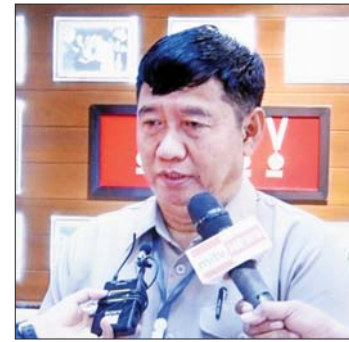
ဦးဌေးအောင်

ကျင်းပခဲ့တဲ့ (၂၇) ကြိမ်မြောက် အရှေ့တောင် အာရှပြိုင်ပွဲမှတ်တမ်းဓာတ်ပုံများ ပြခန်းမှာလည်း အပိုင်း(၃)ပိုင်းခွဲပြီး ပြသထားခြင်းဖြစ်ပါတယ်။ အရှေ့တောင်အာရှအားကစားပြိုင်ပွဲရဲ့ ဖွင့်ပွဲ၊ ပိတ်ပွဲ အခမ်းအနားကျင်းပနေတဲ့ မှတ်တမ်းဓာတ်ပုံ၊ နိုင်ငံတော်အကြီးအကဲတွေနဲ့ ပြည်ထောင်စုဝန်ကြီးတွေ လာရောက်ကြည့်ရှုတဲ့ မှတ်တမ်းဓာတ်ပုံ၊ (၂၇) ကြိမ်မြောက် အရှေ့တောင်အာရှအားကစားပြိုင်ပွဲမတိုင်မီ ကြိုတင်ပြင်ဆင် ဆောင်ရွက်မှု မှတ်တမ်းဓာတ်ပုံ၊ (၂၇) ကြိမ်မြောက် အရှေ့တောင်အာရှအားကစားပြိုင်ပွဲမှာ နိုင်ငံ့ဂုဏ်ဆောင်အားကစားသမားတွေ ယှဉ်ပြိုင်မှုဓာတ်ပုံ၊ ပြိုင်ပွဲပြီးတဲ့အခါ ဆုတံဆိပ်ရယူနေတဲ့ အောင်ပွဲခံ ဓာတ်ပုံတွေနဲ့ အသင်းလိုက် စုပေါင်းမှတ်တမ်းတင် ဓာတ်ပုံတွေကို ခင်းကျင်းပြသထားပါတယ်။ တတိယပြခန်းအနေနဲ့ ၂၀၁၆ ကနေ ၂၀၂၀ အစိုးရလက်ထက်မှာ အားကစားလှုပ်ရှားမှုဆိုင်ရာ ဆောင်ရွက်မှုမှတ်တမ်းတွေကို ခင်းကျင်းပြသထားပါတယ်။ စတုတ္ထပြခန်းအနေနဲ့ မြန်မာ့အားကစားသမားများ မော်ကွန်းခန်းမမှာတော့ ခေတ်အဆက်ဆက် နိုင်ငံ့ဂုဏ်ဆောင် အားကစားသမားကြီးတွေ ရယူပေးခဲ့တဲ့ ဆုဖလား၊ ဆုတံဆိပ်တွေအနက် ရွှေတံဆိပ်လေးခုနဲ့အထက် အများဆုံး နိုင်ငံ့ဂုဏ်ဆောင် အားကစားသမားတွေကို ဂုဏ်ပြုပြီး သူတို့ရဲ့ပုံစံတူရုပ်တုတွေကို ထုလုပ်ပြီး ခန်းမမှာ ခင်းကျင်းပြသထားပါတယ်။ ရွှေတံဆိပ်လေးခုမရဘဲ တစ်ခု၊ နှစ်ခု၊