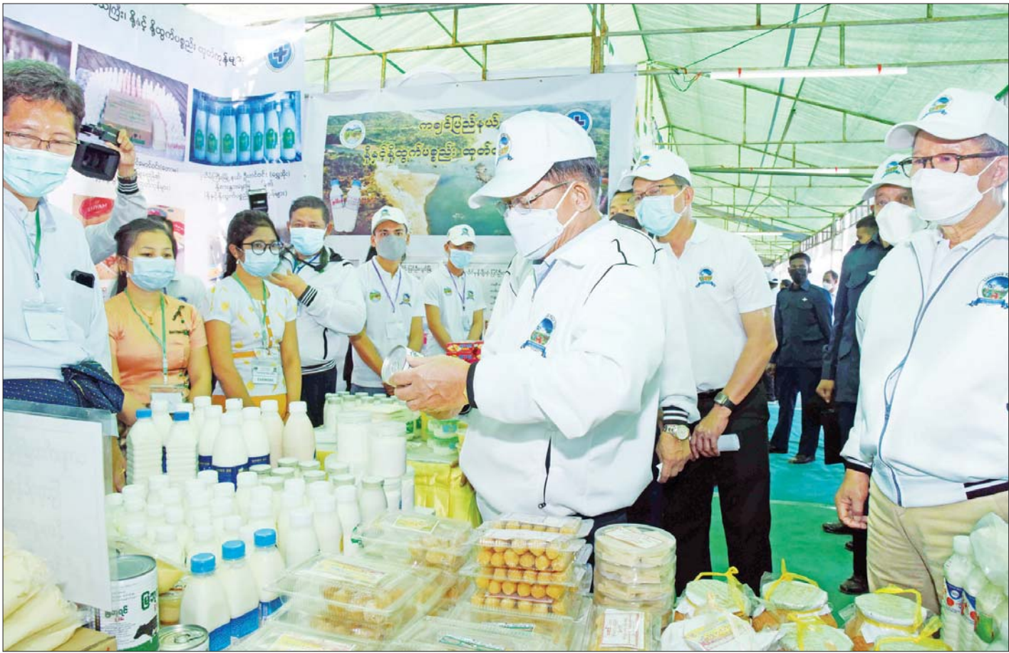
နိုင်ငံတော်စီမံအုပ်ချုပ်ရေးကောင်စီဥက္ကဋ္ဌ နိုင်ငံတော်ဝန်ကြီးချုပ် ဗိုလ်ချုပ်မှူးကြီး မင်းအောင်လှိုင် ၂၀၂၂ ခုနှစ် မွေးမြူရေးတိရစ္ဆာန်ပြပွဲ၊ ပြိုင်ပွဲဖွင့်ပွဲအခမ်းအနားတွင် တန်ဖိုးမြှင့်ထွက်ကုန်များ ခင်းကျင်းပြသထားမှုကို ကြည့်ရှုစဉ်။

ရေ အစာနှင့် ဆေး မလွဲမသွေလိုအပ် စနစ်ကျသည့် မွေးမြူရေးဆိုသည်မှာ မိရိုးဖလာအရ လွှတ်မွေးခြင်း၊ လှောင်မွေးခြင်းနှင့် လှန်မွေးခြင်းဟူ၍ သုံးမျိုးတွေ့ရှိရကြောင်း၊ များသောအားဖြင့် လွှတ်မွေးကြပြီး တချို့က လှောင်မွေးခြင်းနှင့်