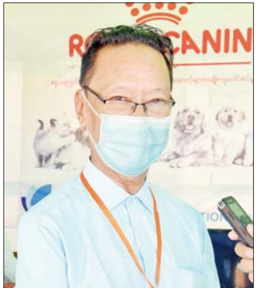
ဒေါက်တာ ဗလ

ဒေါက်တာ အောင်ကြီး (ဒုတိယဝန်ကြီး) စိုက်ပျိုးရေး၊ မွေးမြူရေးနှင့် ဆည်မြောင်းဝန်ကြီးဌာန ကျွန်တော်တို့နိုင်ငံဟာ စိုက်ပျိုးရေးကို အခြေခံတဲ့ နိုင်ငံဖြစ်တယ်။ အထူးသဖြင့် စိုက်ပျိုးရေး၊ မွေးမြူရေးလုပ်ငန်းသည် ကျွန်တော်တို့ တောင်သူတွေရဲ့ လူမှုဘဝ အဆင့်အတန်းတိုးတက်ဖို့ အဓိကဖြစ်တဲ့ အတွက် တောင်သူတွေရဲ့ ဘဝ မြှင့်တင် တိုးတက်ဖို့ကို ရည်ရွယ်ပြီးတော့ ယနေ့ ပြပွဲ၊ ပြိုင်ပွဲကို ပြုလုပ်ပေးတာဖြစ်ပါတယ်။ နောက်တစ်ချက်ကတော့ ကျွန်တော်တို့ နိုင်ငံ ပြည်ပပို့ကုန်ဝင်ငွေ တိုးမြှင့်ရရှိဖို့ အတွက် ဆောင်ရွက်တာလည်း ဖြစ်ပါ တယ်။ ဒီပြပွဲမှာ လက်ရှိ ပြခန်းပေါင်း ၁၅၀ ပတ်ဝန်းကျင်ပြသထားပါတယ်။ ခင်းကျင်း ပြသထားတဲ့ပြခန်းတွေ လိုက်လံကြည့်ရှု လိုက်မယ်ဆိုရင် တစ်ဖက်က ကျွဲ၊ နွား၊ သိုး၊ ဆိတ်၊ နွားနောက်အပါဝင် ပြသထား တာရှိသလို တိရစ္ဆာန်တွေနဲ့ပတ်သက်တဲ့