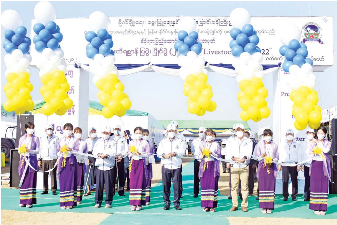
နိုင်ငံတော်စီမံအုပ်ချုပ်ရေးကောင်စီဥက္ကဋ္ဌ နိုင်ငံတော်ဝန်ကြီးချုပ် ဗိုလ်ချုပ်မှူးကြီး မင်းအောင်လှိုင်၊ စိုက်ပျိုးရေး၊ မွေးမြူရေးနှင့်ဆည်မြောင်းဝန်ကြီးဌာန ပြည်ထောင်စုဝန်ကြီးနှင့် နေပြည်တော်ကောင်စီဥက္ကဋ္ဌတို့က (၇၅)နှစ်မြောက် စိန်ရတုပြည်ထောင်စုနေ့အထိမ်းအမှတ် ၂၀၂၂ ခုနှစ် မွေးမြူရေးတိရစ္ဆာန်ပြပွဲ၊ ဖြိုင်ပွဲဖွင့်ပွဲအခမ်းအနားကို ဖဲကြိုးဖြတ်ဖွင့်လှစ်ပေးကြစဉ်။

မိမိတို့နိုင်ငံ၏ လူဦးရေ ၇၀ ရာခိုင်နှုန်းသည်