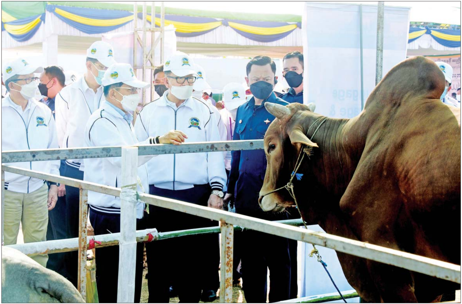
နိုင်ငံတော်စီမံအုပ်ချုပ်ရေးကောင်စီဥက္ကဋ္ဌ နိုင်ငံတော်ဝန်ကြီးချုပ် ဗိုလ်ချုပ်မှူးကြီး မင်းအောင်လှိုင် (၇၅)နှစ်မြောက် စိန်ရတုပြည်ထောင်စုနေ့ အထိမ်းအမှတ် ၂၀၂၂ ခုနှစ် မွေးမြူရေးတိရစ္ဆာန်ပြပွဲ၊ ပြိုင်ပွဲဖွင့်ပွဲအခမ်းအနားတွင် ခင်းကျင်းပြသထားသည့် နွားပြခန်းကို ကြည့်ရှုစဉ်။

နေပြည်တော် ဇန်နဝါရီ ၂၈ (၇၅)နှစ်မြောက် စိန်ရတုပြည်ထောင်စုနေ့ အထိမ်းအမှတ် စိုက်ပျိုးရေး၊ မွေးမြူရေးနှင့် ဆည်မြောင်းဝန်ကြီးဌာန၊ မွေးမြူရေးနှင့် ကုသရေးဦးစီးဌာနနှင့် မြန်မာနိုင်ငံ မွေးမြူရေးလုပ်ငန်းအဖွဲ့ချုပ်တို့ ပူးပေါင်းပြုလုပ်သည့် ၂၀၂၂ ခုနှစ် မွေးမြူရေးတိရစ္ဆာန်ပြပွဲ၊ ပြိုင်ပွဲဖွင့်ပွဲအား ယနေ့နံနက်ပိုင်းတွင် နေပြည်တော်ကောင်စီနယ်မြေ၊ ပုဗ္ဗသီရိမြို့နယ်၊ ကိုးရွာသပြေကုန်းကျေးရွာအနီးရှိ စက်စက်ယိုကွင်း၌ ကျင်းပပြုလုပ်ရာ နိုင်ငံတော်စီမံအုပ်ချုပ်ရေးကောင်စီဥက္ကဋ္ဌ နိုင်ငံတော်ဝန်ကြီးချုပ် ဗိုလ်ချုပ်မှူးကြီး မင်းအောင်လှိုင် တက်ရောက်ဖွင့်လှစ်ပေးသည်။ ဖွင့်ပွဲအခမ်းအနားသို့ ကောင်စီအဖွဲ့ဝင်များဖြစ်ကြသည့် ဗိုလ်ချုပ်ကြီး မြထွန်းဦး၊ ဦးသိန်းညွန့်၊ ဦးခင်မောင်ဆွေ၊ ဦးစောဒန်နီယယ်၊ ဦးရွှေကြိမ်း၊ ကောင်စီအတွင်းရေးမှူး ဒုတိယဗိုလ်ချုပ်ကြီး အောင်လင်းခွေး၊ ပြည်ထောင်စုဝန်ကြီးများ၊ နေပြည်တော်ကောင်စီဥက္ကဋ္ဌနှင့် တာဝန်ရှိသူများ၊ မြန်မာနိုင်ငံ တိရစ္ဆာန်ဆေးကုသရာဝန်များအသင်း၊ မြန်မာနိုင်ငံ တိရစ္ဆာန်ဆေးပညာကောင်စီ၊ မြန်မာနိုင်ငံ မွေးမြူရေးလုပ်ငန်းအဖွဲ့ချုပ် (ရန်ကုန်)၊ စာမျက်နှာ ၃ ကော်လံ ၁