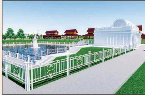
မုစလိန္နုအိုင်

၁။ နိုင်ငံတော်စီမံအုပ်ချုပ်ရေးကောင်စီဥက္ကဋ္ဌ၊ တပ်မတော်ကာကွယ်ရေးဦးစီးချုပ် ဗိုလ်ချုပ်မှူးကြီးမင်းအောင်လှိုင် ဦးဆောင်သည့် (၇)ရက်သား၊ သမီး၊ ဘုရားဒါယကာ၊ ဒါယိကာမတို့က မာရဝိဇယပုဒ္ဓရုပ်ပွားတော်မြတ်ကြီးအား မြန်မာနိုင်ငံတွင် ထေရဝါဒပုဒ္ဓသာသနာတော်ထွန်းလင်းတောက်ပလျက်ရှိသည်ကို ကမ္ဘာကိုပြသရန်၊ တိုင်းပြည်အေးချမ်းသာယာမှုရှိစေရန်၊ ရုပ်ပွားတော်မြတ်ကြီးအား ပြည်တွင်း၊ ပြည်ပဘုရားဖူးများလာရောက်ခြင်းဖြင့် ဒေသတိုးတက်စည်ကားမှုကို အထောက်အကူဖြစ်စေရန်၊ နိုင်ငံတော်ဖွံ့ဖြိုးတိုးတက်မှုအား အထောက်အကူဖြစ်စေရန် ရည်သန်လျက် ပြည်ထောင်စုနယ်မြေ နေပြည်တော်၊ ဒက္ခိဏသီရိမြို့နယ်အတွင်း၌ သာသနာတော်ထိုး၊ ရုပ်ပွားဆင်းတုတော်ထိုး၊ မြန်မာ့ရိုးရာတည်ထုံးများနှင့်အညီ တည်ဆောက်ပူဇော်လျက် ရှိပါသည်။