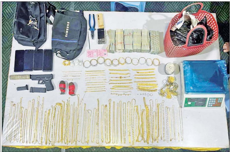
လုယက်မှုကျူးလွန်သည့် တရားခံများထံမှ သိမ်းဆည်းရမိသည့် လက်နက်ခဲယမ်းနှင့် သက်သေခံပစ္စည်းများ။