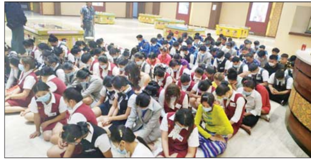
လှိုင်သာယာ(အရှေ့ပိုင်း)မြို့နယ် ညောင်ကျေးရွာ ပန်းလှိုင်ဂေါက်ကွင်းလမ်း အမှတ်(၁၅၄) မြန်မာတော်ဝင်ကျောက်စိမ်းစင်တာကုမ္ပဏီလီမိတက်၌ လောင်းကစားဖမ်းဆီးရမိမှု မှတ်တမ်းဓာတ်ပုံ။