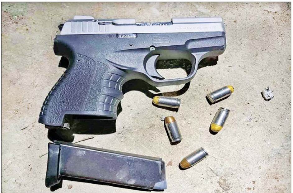
တရားခံ ဆန္ဒအောင် (ခ) မောင်ဆန်ထံမှ သိမ်းဆည်းရမိသည့် လက်နက်ခဲယမ်းများ။