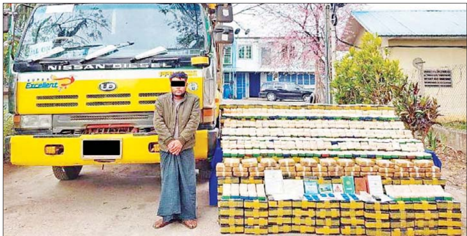
ဇော်ဌေး(ခ)အကြီး ကို သိမ်းဆည်းရမိသည့် မူးယစ်ဆေးဝါးများနှင့်အတူ တွေ့ရစဉ်။

ပြင်ဦးလွင်-မန္တလေးသွားကားလမ်း မိုင်တိုင် အမှတ်(၂၂/၀)အနီးတွင် FUSO ၁၂ဘီး မော်တော်ယာဉ် အား စစ်ဆေးရာ ယာဉ်မောင်းအား တွေ့ရှိခြင်း မရှိဘဲ ယာဉ်ပေါ်မှ ဘီလီယံကျပ် ၃၂ ဒသမ ၉ ကီလို ထပ်မံ သိမ်းဆည်းရမိခဲ့သဖြင့် ဒေသကာလတန်ဖိုးငွေကျပ် ၂ ဒသမ ၅၂ ကီလို၊ စိတ်ကြွေးသွပ်ဆေးပြား ၂ ဒသမ ၂၈ သိန်း သိမ်းဆည်းရမိခဲ့ကြောင်း၊ စစ်ဆေးဖော်ထုတ် ချက်အရ သိမ်းဆည်းရမိ မူးယစ်ဆေးဝါးများအား ရှမ်းပြည်နယ် (မြောက်ပိုင်း)မှ မန္တလေးတိုင်းဒေသကြီး သို့ သယ်ဆောင်ခြင်းဖြစ်ကြောင်း သိရှိရသဖြင့် ၎င်းအား ဥပဒေအရအရေးယူထားရှိပြီး ကွင်းဆက် ပြစ်မှုကျူးလွန်သူများအား ဆက်လက်စစ်ဆေး ဖော်ထုတ်လျက်ရှိကြောင်း သိရသည်။ သတင်းစဉ်