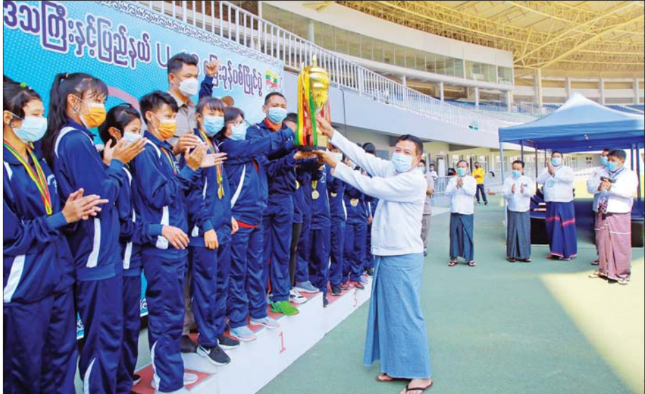
ကလည်းကောင်း။ (အမျိုးသား) မိတာ (၄၀၀x၄) လက်ဆင့်ကမ်း ပြိုင်ပွဲတွင် ပထမဆုရရှိသူများသော စစ်ကိုင်းတိုင်းဒေသကြီးအသင်း၊ ဒုတိယဆုရရှိသူများသော တနင်္သာရီတိုင်းဒေသကြီးအသင်း၊ တတိယဆုရရှိသူများသော ရန်ကုန်တိုင်းဒေသကြီးအသင်းတို့ကို အားကစားနှင့် လူငယ်ရေးရာဝန်ကြီးဌာန ဒုတိယဝန်ကြီး ဦးမျိုးလှိုင်က လည်းကောင်း။ ရွှေ (၁)၊ ငွေ (၅)၊ ကြေး (၃) ခုဖြင့် (အမျိုးသမီး) တံခွန်စိုက်ဆု ရရှိသူများသော တနင်္သာရီတိုင်းဒေသကြီးအသင်း၊ ရွှေ (၁)၊ ငွေ (၁)၊ ကြေး (၁) ခုဖြင့် (အမျိုးသား) တံခွန်စိုက်ဆု ရရှိသူများသော တနင်္သာရီတိုင်းဒေသကြီးအသင်း၊ ရွှေ (၂)၊ ငွေ (၆)၊ ကြေး (၄) ခုဖြင့် စုပေါင်းတံခွန်စိုက်ဆု ရရှိသူများသော တနင်္သာရီတိုင်းဒေသကြီးအသင်းကို အားကစားနှင့် လူငယ်ရေးရာဝန်ကြီးဌာန ပြည်ထောင်စုဝန်ကြီး ဦးမင်းသိန်းမံကလည်းကောင်း ဆုများပေးအပ်ချီးမြှင့်ခဲ့ကြောင်း သိရသည်။ သတင်းစဉ်

(အမျိုးသမီး) မိတာ (၁၀၀) အပြေးပြိုင်ပွဲတွင် ပထမ၊ ဒုတိယ၊ တတိယဆုရရှိသူများနှင့် (အမျိုးသား/အမျိုးသမီး) မိတာ (၁၀၀x၄) လက်ဆင့်ကမ်းပြိုင်ပွဲတွင် ပထမဆုရရှိသူများသော တနင်္သာရီတိုင်းဒေသကြီး အသင်း၊ ဒုတိယဆုရရှိသူများသော စစ်ကိုင်းတိုင်းဒေသကြီးအသင်းနှင့် တတိယဆုရရှိသူများသော ရန်ကုန်တိုင်းဒေသကြီးအသင်းတို့ကို အားကစားနှင့်ကာယ ပညာဦးစီးဌာန တာဝန်ရှိသူများကလည်းကောင်း၊ (အမျိုးသား) မိတာ (၁၀၀) အပြေးပြိုင်ပွဲ၊ (အမျိုးသား) သုံးဆင့်ခုန်ပြိုင်ပွဲတွင် ပထမ၊ ဒုတိယ၊ တတိယဆုရရှိသူများကို အားကစားနှင့်လူငယ်ရေးရာဝန်ကြီးဌာန ဒုတိယအမြဲတမ်းအတွင်းဝန် ဦးကျော်ဆန်းက လည်းကောင်း၊ (အမျိုးသမီး) မိတာ (၄၀၀x၄) လက်ဆင့်ကမ်း ပြိုင်ပွဲတွင် ပထမဆုရရှိသူများသော တနင်္သာရီတိုင်းဒေသကြီးအသင်း၊ ဒုတိယဆုရရှိသူများသော ရှမ်းပြည်နယ်အသင်း၊ တတိယဆုရရှိသူများသော စစ်ကိုင်းတိုင်းဒေသကြီးအသင်းတို့ကို အားကစားနှင့်ကာယ ပညာဦးစီးဌာန ညွှန်ကြားရေးမှူးချုပ် ဦးထွန်းမြင့်ဦး