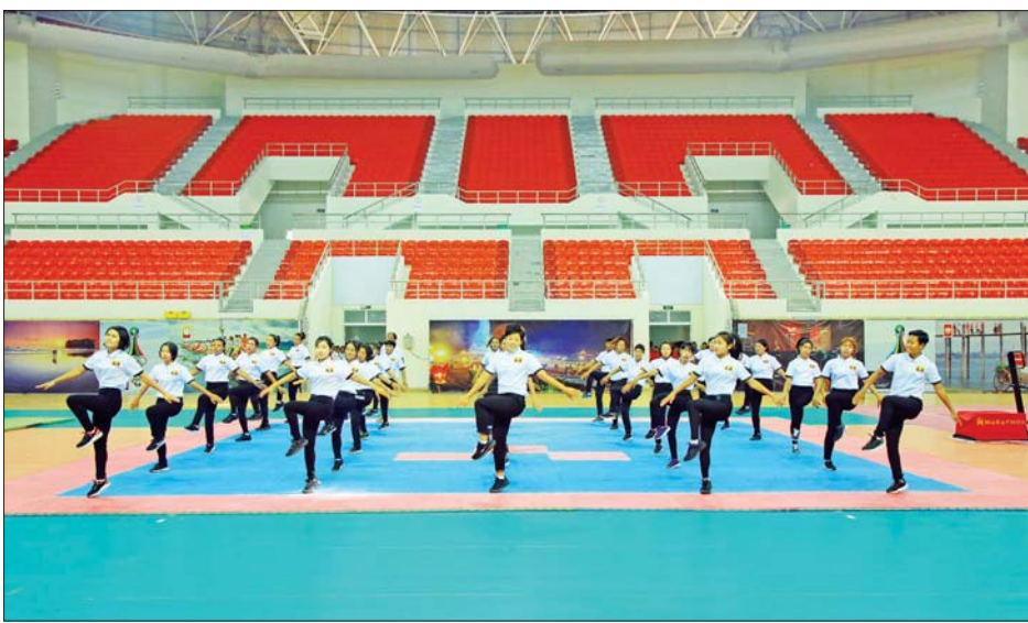
အားကစားနှင့် လူငယ်ရေးရာဝန်ကြီးဌာန ဝန်ထမ်းများက Fitness Dance သရုပ်ပြဖျော်ဖြေစဉ်။

(နိုင်ငံတော်စီမံအုပ်ချုပ်ရေးကောင်စီဥက္ကဋ္ဌ နိုင်ငံတော်ဝန်ကြီးချုပ် ဗိုလ်ချုပ်မှူးကြီး မင်းအောင်လှိုင် ၁၇-၁-၂၀၂၂ ရက်နေ့တွင် အဆင့်မြင့်ပညာကဏ္ဍ လုပ်ငန်းညှိနှိုင်းအစည်းအဝေး၌ ပြောကြားသည့် အမှာစကားမှ ကောက်နုတ်ချက်)