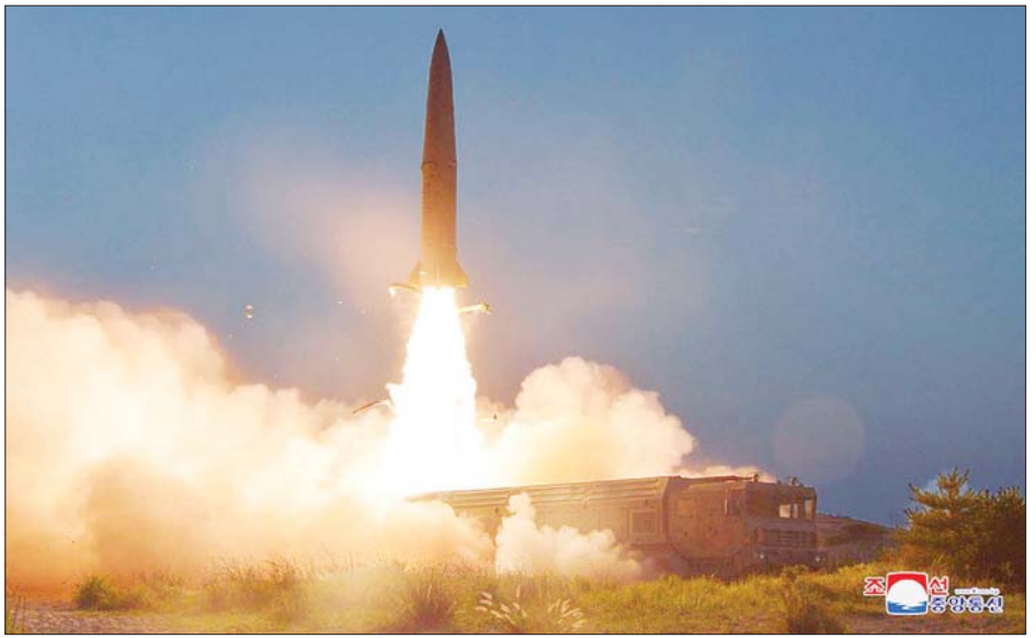
မြောက်ကိုရီးယားနိုင်ငံက ပစ်လွှတ်လိုက်သော ခုံးကျည်တစ်စင်းကိုတွေ့ရစဉ်။

အင်္ဂါနေ့ကလည်း မြောက်ကိုရီးယားသည် နျူကလီးယားခုံးကျည်များကို ပစ်လွှတ်စမ်းသပ်ခဲ့သည်။ ဇန်နဝါရီ ၂၇ ရက်က ပစ်လွှတ်စမ်းသပ်မှုသည် ယခုနှစ်အတွင်း မြောက်ကိုရီးယား၏ မြောက်ကြိမ်မြောက် ပစ်လွှတ်စမ်းသပ်ခဲ့ခြင်းပြီး ပြုယမ်း၏ စစ်ရေးစွမ်းပကားကို တိုးချဲ့ရန် ရည်ရွယ်ချက်ကို ထင်ရှားစေရန် မီးမောင်းထိုးပြလိုက်ခြင်းဖြစ်သည်။ မြောက်ကိုရီးယားအာဏာပိုင်တို့ဖြစ်သည့် အလုပ်သမားပါတီနိုင်ငံရေးဗျူရိုက ဇန်နဝါရီ ၁၉ ရက် အစည်းအဝေးတွင် အမေရိကန်၏နယ်ချဲ့ဝါဒကို