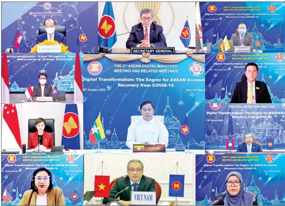
ရိုသူးများ အပါအဝင် ကိုယ်စားလှယ် စုစုပေါင်း ၇၆ ဦး တက်ရောက်ကြသည်။ (အပေါ်ပုံ) ASEAN သီချင်းတို့ကို ဂုဏ်ပြုဖွင့်လှစ်သည်။ ပြည်ထောင်စုသမ္မတ မြန်မာနိုင်ငံတော်သီချင်းနှင့် အဖွင့်အမှာစကားပြောကြား အစည်းအဝေး ဖွင့်ပွဲအခမ်းအနားတွင် အစီအစဉ်အရ ဒုတိယအကြိမ်မြောက် အာဆီယံ

အစည်းအဝေးသို့ ပို့ဆောင်ရေးနှင့် ဆက်သွယ်ရေးဝန်ကြီးဌာန ပြည်ထောင်စုဝန်ကြီး ဗိုလ်ချုပ်ကြီး တင်အောင်စန်း ဦးဆောင်၍ ဒုတိယဝန်ကြီး၊ အမြဲတမ်းအတွင်းဝန်၊ ညွှန်ကြားရေးမှူးချုပ်နှင့် သက်ဆိုင်ရာ တာဝန်ရှိသူများက နေပြည်တော်ရှိ ပို့ဆောင်ရေးနှင့် ဆက်သွယ်ရေး ဝန်ကြီးဌာန ပြည်ထောင်စုဝန်ကြီးရုံး အစည်းအဝေးခန်းမမှ တက်ရောက်ကြပြီး အာဆီယံ ၁၀ နိုင်ငံမှ ဒစ်ဂျစ်တယ်ဆိုင်ရာ ဝန်ကြီးများ၊ ဒုတိယဝန်ကြီးများ၊ အာဆီယံ အထွေထွေအတွင်းရေးမှူးချုပ်နှင့် တာဝန်