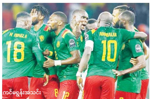
ကင်မရွန်းအသင်း နိုင်ပွဲရရှိပြီး နောက်တစ်ဆင့်တက်ရောက်သွားနိုင်မလဲ စိတ်ဝင်စားဖွယ် စောင့်ကြည့်ရမည် ဖြစ်သည်။ အခြားသော ကွာတားဖိုင်နယ်ပွဲစဉ်အဖြစ် ဇန်နဝါရီ ၃၀ ရက် နံနက်ပိုင်းတွင် ဘာကီနာဖာဆိုအသင်းနှင့် တူနီးရှား အသင်းတို့ ယှဉ်ပြိုင်ကစားမည် ဖြစ်သည်။ အောင်ဇော်

နောက်ဆုံးဆွတ်ခူးထားသည့်အတွက် အောင်မြင်မှုနှင့် ဝေးကွာနေသည်ဟု ဆိုနိုင်သည်။ ကွန်ဒီ၊ ချူပိုမိုတင်း၊ အဘူဘက်ကာ၊ အီကမီဘီ စသည့် ကစားသမားကောင်းများဖြင့် ဖွဲ့စည်းထားပြီး နောက်တစ်ဆင့် တက်ရောက်နိုင်ရေးကြိုးစားလာမည့် ကင်မရွန်းအသင်းကို ဂမ်ဘီယာ အသင်း အနိုင်ရရှိဖို့ အခက်တွေ့ဖွယ်ရှိသည်။ ထို့အပြင် ဂမ်ဘီယာ အသင်းနှင့် ကင်မရွန်းအသင်းတို့ နောက်ဆုံးနှစ်ကြိမ်ထိတိုက် တွေ့ဆုံမှုတွင် ကင်မရွန်းအသင်းကသာ နှစ်ကြိမ်စလုံး အနိုင်ရရှိထားသည်ကို တွေ့ရသည်။ ယခုပွဲစဉ်တွင် သမိုင်းသစ်ရေးထိုးနိုင်ရေး အကောင်းဆုံးပြင်ဆင်လာမည့် ဂမ်ဘီယာအသင်းနှင့် ၂၀၁၇ ခုနှစ် နောက်ပိုင်း ဆုဖလားနှင့် ဝေးကွာနေသည့် ကင်မရွန်းအသင်းတို့ တွေ့ဆုံမှုက ပရိသတ်အကြိုက် ပွဲကောင်းတစ်ပွဲ ဖြစ်လာဖွယ်ရှိသည်။ ထို့ကြောင့် မည်သည့်အသင်းက