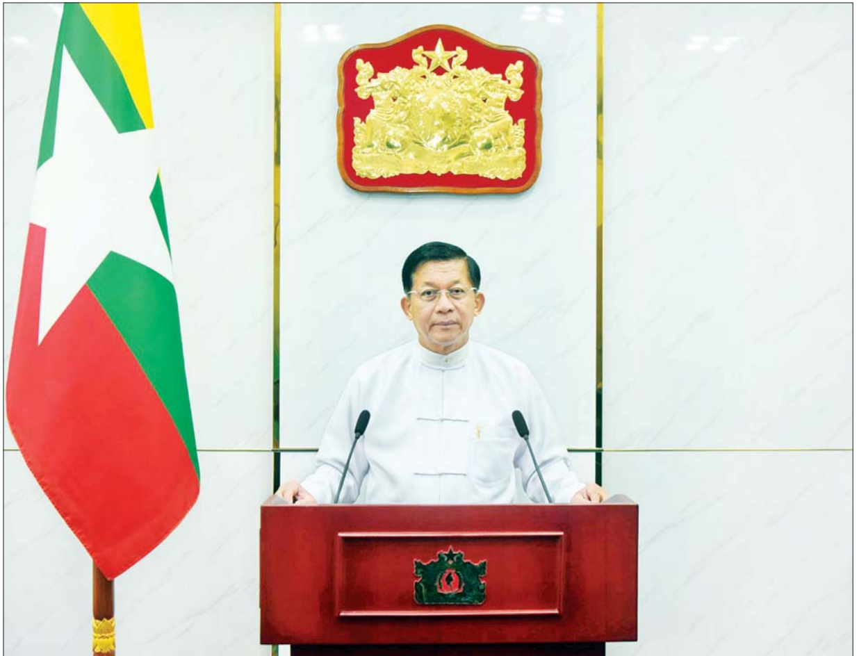
ဒုတိယအကြိမ် အာဆီယံဒစ်ဂျစ်တယ်ဆိုင်ရာ ဝန်ကြီးများ အစည်းအဝေးသို့ နိုင်ငံတော်စီမံအုပ်ချုပ်ရေးကောင်စီဥက္ကဋ္ဌ နိုင်ငံတော်ဝန်ကြီးချုပ် ဗိုလ်ချုပ်မှူးကြီး မင်းအောင်လှိုင် ပေးပို့သည့် အဖွင့်အမှာစကား ပြောကြားစဉ်။

ဒါ့ကြောင့် အာဆီယံ ခေါင်းဆောင်များအနေနဲ့ ကလည်း “အာဆီယံတွင် ဒစ်ဂျစ်တယ်အသွင်ကူးပြောင်းမှုကို မြှင့်တင်ခြင်း ဆိုင်ရာ အာဆီယံခေါင်းဆောင်များ၏ ထုတ်ပြန်ချက်”မှာ အားလုံး ပါဝင်နိုင်တဲ့ ဒစ်ဂျစ်တယ် အသွင်ကူးပြောင်းမှုကို ဖော်ဆောင်နိုင်