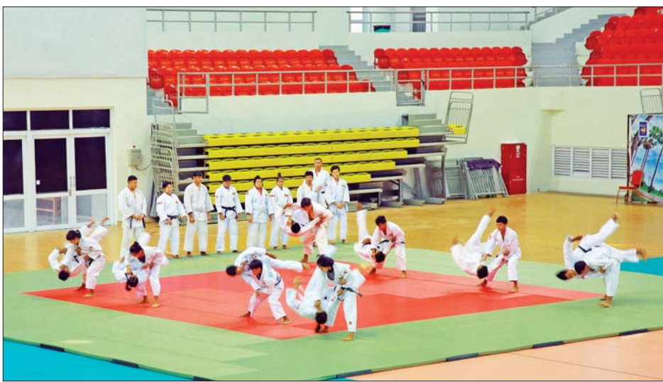
(၃၁) ကြိမ်မြောက် အရှေ့တောင်အာရှ အားကစားပြိုင်ပွဲတွင် ဝင်ရောက်ယှဉ်ပြိုင်ကြမည့် အားကစားသမားများ သရုပ်ပြလေ့ကျင့်နေစဉ်။