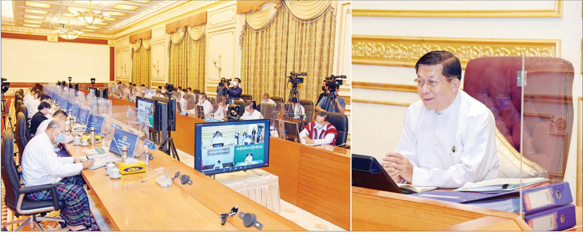
နိုင်ငံတော်စီမံအုပ်ချုပ်ရေးကောင်စီဥက္ကဋ္ဌ နိုင်ငံတော်ဝန်ကြီးချုပ် ဗိုလ်ချုပ်မှူးကြီး မင်းအောင်လှိုင် ပြည်ထောင်စုသမ္မတမြန်မာနိုင်ငံတော် လုံခြုံရေး၊ တည်ငြိမ်အေးချမ်းရေးနှင့် တရားဥပဒေစိုးမိုးရေးကော်မတီ အစည်းအဝေးအမှတ်စဉ် (၁/၂၀၂၂) တွင် အမှာစကားပြောကြားစဉ်။

နေပြည်တော် ဇန်နဝါရီ ၂၇ ပြည်ထောင်စုသမ္မတမြန်မာနိုင်ငံတော် လုံခြုံရေး၊ တည်ငြိမ်အေးချမ်းရေးနှင့် တရားဥပဒေစိုးမိုးရေးကော်မတီ အစည်းအဝေးအမှတ်စဉ် (၁/၂၀၂၂) ကို ယနေ့မွန်းလွဲပိုင်းတွင် နေပြည်တော်ရှိ နိုင်ငံတော်စီမံအုပ်ချုပ်ရေးကောင်စီဥက္ကဋ္ဌရုံး အစည်းအဝေးခန်းမ၌ကျင်းပရာ လုံခြုံရေး၊ တည်ငြိမ်အေးချမ်းရေးနှင့် တရားဥပဒေစိုးမိုးရေးကော်မတီဥက္ကဋ္ဌ နိုင်ငံတော်စီမံအုပ်ချုပ်ရေးကောင်စီဥက္ကဋ္ဌ နိုင်ငံတော်ဝန်ကြီးချုပ် ဗိုလ်ချုပ်မှူးကြီး မင်းအောင်လှိုင် တက်ရောက်အမှာစကား ပြောကြားသည်။