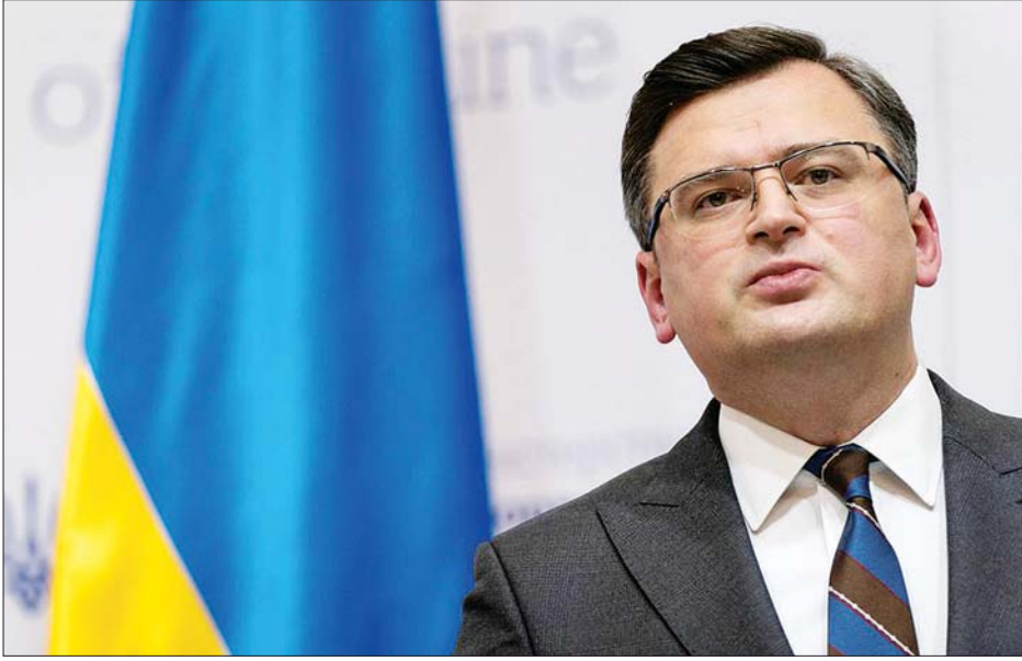
ယူကရိန်းနိုင်ငံခြားရေးဝန်ကြီး ဒယ်မီထရီ ကိုဇက်က တွေ့ရစဉ်။

ယူကရိန်းအရေး တင်းမာမှုများ လျော့ချရန် ဂျာမနီနှင့် ပြင်သစ်တို့ ပူးပေါင်းလုပ်ဆောင်လျက်ရှိသည်။ နှစ်နိုင်ငံမှ အဆင့်မြင့်သံတမန်များသည် ရုရှားနှင့် ယူကရိန်းကိုယ်စားလှယ်များကို ပါရီတွင် ဇန်နဝါရီ ၂၆ ရက်က တွေ့ဆုံခဲ့သည်။ ဆွေးနွေးပွဲပြီးနောက် ရုရှားအဓိကညှိနှိုင်းရေးမှူး ဒီမီထရီ ကိုဇက်က အဖွဲ့လေးဖွဲ့လုံးသည် တင်းမာမှုများ နည်းသွားစေရန် ဆွေးနွေးမှုများ ဆက်လက်လုပ်ဆောင်သွားရန် သဘောတူခဲ့ကြောင်း ပြောသည်။