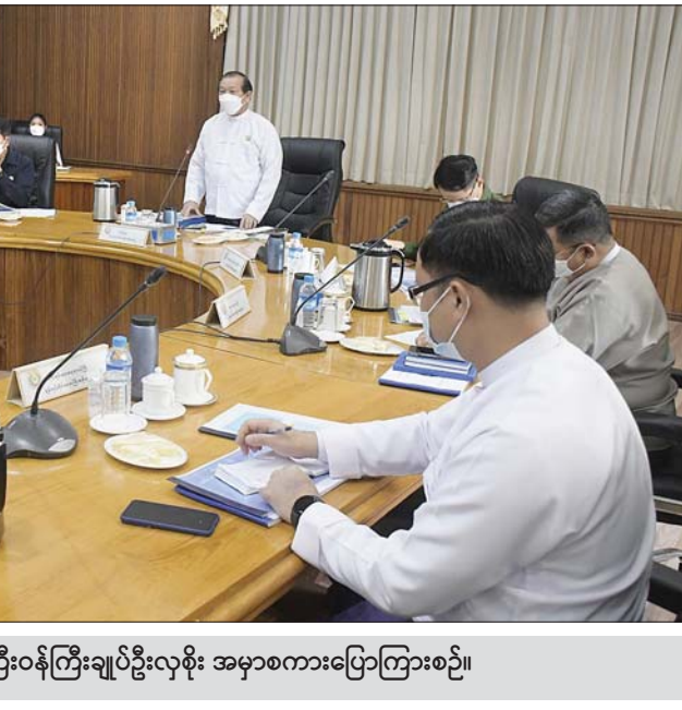
အစည်းအဝေးတွင် တိုင်းဒေသကြီးဝန်ကြီးချုပ်ဦးလှစိုး အမှာစကားပြောကြားစဉ်။

လုပ်ငန်းကော်မတီအသီးသီးမှ တာဝန်ရှိသူများက အကြံပြု ကြိုးပမ်းဆောင်ရွက်ပေးကြရန် ပြောကြား သည်။ ထို့နောက် လုံခြုံရေးနှင့်စည်းကမ်းပြည့်ဝရေး၊ စီမံခန့်ခွဲရေး၊ သာယာသန့်ရှင်းလှပရေး၊ စီးပွားဖွံ့ဖြိုး တိုးတက်ရေး၊ ကျန်းမာသန့်စွမ်းရေး၊ ပြည်သူ့ရေးရာ ဝန်ဆောင်မှု စသည့်လုပ်ငန်းကော်မတီများမှ တာဝန် ရှိသူများက ကော်မတီအလိုက် ဆောင်ရွက်လျက်ရှိ သော လုပ်ငန်းစဉ်များနှင့် ဆက်လက်ဆောင်ရွက် မည့် ရှေ့လုပ်ငန်းစဉ်များကို ရှင်းလင်းတင်ပြကာ တိုင်းဒေသကြီးဝန်ကြီးချုပ်က ကော်မတီအလိုက် ဆောင်ရွက်ရမည့်လုပ်ငန်းများနှင့် ကော်မတီများ ဟန်ချက်ညီညီ ပူးပေါင်းဆောင်ရွက်ကြရန် ပြောကြား ခဲ့သည်။ ဆန်းကျော်ဦး(ပြန်/ဆက်)