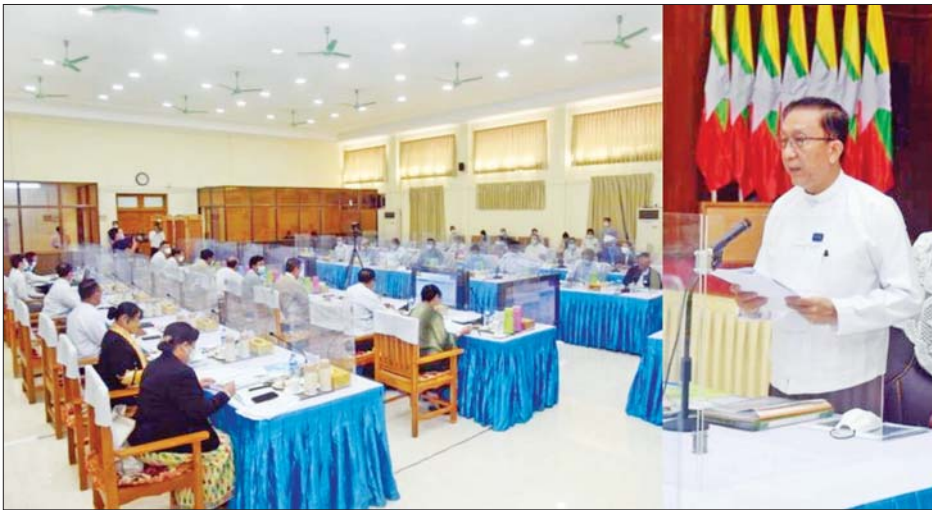
ဒေသကြီး၊ ရှမ်းပြည်နယ် ဆောင်ရွက်မှုလုပ်ငန်းအဖွဲ့ ဥက္ကဋ္ဌ နှင့် ဧရာဝတီတိုင်းဒေသကြီးတို့မှ များနှင့် တာဝန်ရှိသူများ တက်ရောက်ကြသည်။ မြန်မာ စီးပွားရေးစင်္ကြံ ပူးတွဲကော်မတီဥက္ကဋ္ဌ စီမံကိန်းနှင့် ဘဏ္ဍာရေး ဝန်ကြီးဌာန ပြည်ထောင်စုဝန်ကြီး ဦးဝင်းရှိန်က

နေပြည်တော် ဇန်နဝါရီ ၂၇ တရုတ်-မြန်မာ စီးပွားရေးစင်္ကြံ အကောင်အထည်ဖော် ဆောင်ရွက်မှုနှင့် စပ်လျဉ်း၍ သက်ဆိုင်ရာ ဝန်ကြီးဌာနများနှင့် ညှိနှိုင်း အစည်းအဝေးကို ယနေ့နံနက် ၉ နာရီတွင်စီမံကိန်းနှင့်ဘဏ္ဍာရေး ဝန်ကြီးဌာန အစည်းအဝေးခန်းမ၌ ကျင်းပသည်။ အစည်းအဝေးသို့သက်ဆိုင်ရာ ဝန်ကြီးဌာနများမှ တရုတ်-မြန်မာ စီးပွားရေးစင်္ကြံ ပူးတွဲကော်မတီ အဖွဲ့ဝင် ဒုတိယဝန်ကြီးများ၊ မြန်မာနိုင်ငံတော် ဗဟိုဘဏ် ဒုတိယဥက္ကဋ္ဌ၊ မကွေးတိုင်းဒေသကြီး၊ မန္တလေးတိုင်းဒေသကြီး၊ ရခိုင်ပြည်နယ်၊ ရန်ကုန်တိုင်း