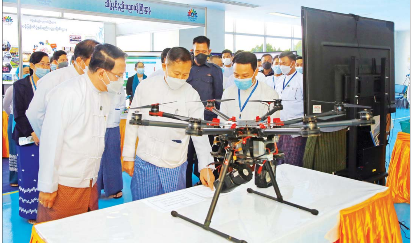
နိုင်ငံတော်စီမံအုပ်ချုပ်ရေးကောင်စီ ဒုတိယဥက္ကဋ္ဌ ဒုတိယဝန်ကြီးချုပ် ဒုတိယဗိုလ်ချုပ်မှူးကြီး စိုးဝင်း စိန်ရတုပြည်ထောင်စုနေ့အထိမ်းအမှတ် လူငယ်နှင့်စာပေပွဲတော်အတွက် ဝန်ကြီးဌာနအလိုက် ပြခန်းများ ခင်းကျင်းပြသထားမှုကို ကြည့်ရှုစစ်ဆေးစဉ်။

နေပြည်တော် ဇန်နဝါရီ ၂၇ နိုင်ငံတော်စီမံအုပ်ချုပ်ရေးကောင်စီ ဒုတိယဥက္ကဋ္ဌ ဒုတိယဝန်ကြီးချုပ် ဒုတိယဗိုလ်ချုပ်မှူးကြီး စိုးဝင်းသည် ယနေ့နံနက်ပိုင်းတွင် ဝဏ္ဏသိဒ္ဓိအားကစားကွင်း၌ ကျင်းပမည့် စိန်ရတုပြည်ထောင်စုနေ့ အထိမ်းအမှတ် လူငယ်နှင့်စာပေပွဲတော်အတွက် ကြိုတင်ပြင်ဆင်ဆောင်ရွက်ထားမှု အခြေအနေများကို ကြည့်ရှုစစ်ဆေးသည်။ ရှေးဦးစွာ နိုင်ငံတော်စီမံအုပ်ချုပ်ရေးကောင်စီ ဒုတိယဥက္ကဋ္ဌ ဒုတိယဝန်ကြီးချုပ် ဒုတိယဗိုလ်ချုပ်မှူးကြီး စိုးဝင်း အား ပြည်ထောင်စုဝန်ကြီးဦးမောင်မောင်အုန်း၊ ဒေါက်တာ မျိုးသိန်းကျော်၊ ဦးမင်းသိန်းဇံနှင့် နေပြည်တော်ကောင်စီဥက္ကဋ္ဌ ဒေါက်တာမောင်မောင်နိုင် တို့က လူငယ်နှင့် စာပေပွဲတော် ကျင်းပမည့်အစီအစဉ်နှင့် ပြခန်းများ ခင်းကျင်းပြသထားမှုကို ရှင်းလင်းတင်ပြကြသည်။ ထို့နောက် နိုင်ငံတော်စီမံအုပ်ချုပ်ရေးကောင်စီ ဒုတိယဥက္ကဋ္ဌ ဒုတိယဝန်ကြီးချုပ် ဒုတိယဗိုလ်ချုပ်မှူးကြီး စိုးဝင်း သည် ဝန်ကြီးဌာနအလိုက် ခင်းကျင်းပြသမည့် ပြခန်းများ၊ မြန်မာနိုင်ငံ လေကြောင်းပညာရပ်ဆိုင်ရာ ပြခန်းများကို ကြည့်ရှုစစ်ဆေးကာ စာမျက်နှာ ၇ ကော်လံ ၁ ❖