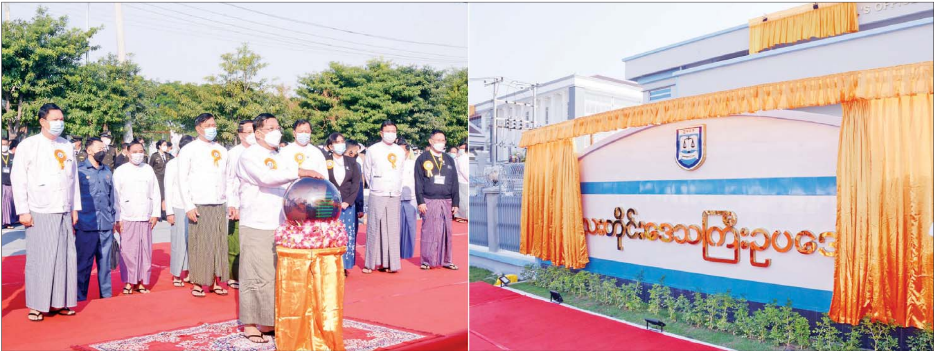
နိုင်ငံတော်စီမံအုပ်ချုပ်ရေးကောင်စီဥက္ကဋ္ဌ၊ နိုင်ငံတော်ဝန်ကြီးချုပ် ဗိုလ်ချုပ်မှူးကြီး မင်းအောင်လှိုင် မန္တလေးတိုင်းဒေသကြီး ဥပဒေချုပ်ရုံး ဆိုင်းဘုတ်အား စက်ခလုတ်နှိပ်ဖွင့်လှစ်ပေးစဉ်။

နိုင်ငံတော်စီမံအုပ်ချုပ်ရေးကောင်စီ၏ ရှေ့လုပ်ငန်းစဉ် (၅) ရပ် ၁။ ပြည်ထောင်စုရွေးကောက်ပွဲကော်မရှင်ကို ပြန်လည်ဖွဲ့စည်းပြီး မဲစာရင်းများစစ်ဆေးခြင်းများအပါအဝင် လုပ်ဆောင်သင့်၊ လုပ်ဆောင်ထိုက်သည်များကို ဥပဒေနှင့်အညီ ဆက်လက်လုပ်ဆောင်သွားမည်။ ၂။ လတ်တလော ဖြစ်ပွားနေဆဲဖြစ်သည့် COVID-19 ကပ်ရောဂါ ကာကွယ်ရေးလုပ်ငန်းများကို အရှိန်အဟုန်မပျက် ထိထိရောက်ရောက် ဆက်လက်ဆောင်ရွက်သွားမည်။ ၃။ COVID-19 ကပ်ရောဂါကြောင့် ထိခိုက်ခဲ့သည့် စီးပွားရေးလုပ်ငန်းများအား ဖြစ်နိုင်သမျှ နည်းလမ်းများဖြင့် အမြန်ဆုံးကုစားသွားမည်။ ၄။ တစ်နိုင်ငံလုံး ထာဝရငြိမ်းချမ်းရေးရရှိရေးအတွက် တစ်နိုင်ငံလုံး ပစ်ခတ်တိုက်ခိုက်မှု ရပ်စဲရေးသဘောတူစာချုပ် (NCA) ပါ သဘောတူညီချက်များအတိုင်း ဖြစ်နိုင်သမျှ အလေးထား လုပ်ဆောင်သွားမည်။ ၅။ အရေးပေါ်ကာလဆိုင်ရာ ပြဋ္ဌာန်းချက်များနှင့်အညီ ဆောင်ရွက်ပြီးစီးပါက ဖွဲ့စည်းပုံအခြေခံဥပဒေ (၂၀၀၈ ခုနှစ်) နှင့်အညီ လွတ်လပ်ပြီး တရားမျှတသော ပါတီစုံဒီမိုကရေစီအထွေထွေရွေးကောက်ပွဲအား ပြန်လည်ကျင်းပ၍ အနိုင်ရသည့်ပါတီအား ဒီမိုကရေစီစံနှုန်းများနှင့်အညီ နိုင်ငံတော်တာဝန်အား လွှဲအပ်နိုင်ရေး ဆက်လက်ဆောင်ရွက်သွားမည်။