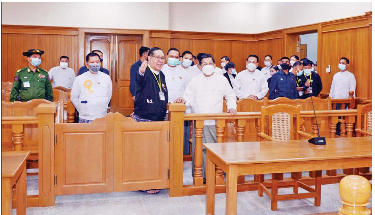
နိုင်ငံတော်စီမံအုပ်ချုပ်ရေးကောင်စီဥက္ကဋ္ဌ၊ နိုင်ငံတော်ဝန်ကြီးချုပ် ဗိုလ်ချုပ်မှူးကြီး မင်းအောင်လှိုင်နှင့်အဖွဲ့ဝင်များ မန္တလေးတိုင်းဒေသကြီး တရားလွှတ်တော်အဆောက်အအုံအတွင်း လှည့်လည်ကြည့်ရှုစဉ်။

ထို့နောက် ပြည်ထောင်စုတရားသူကြီးချုပ်က မန္တလေးတိုင်းဒေသကြီး တရားလွှတ်တော်အဆောက်အအုံသစ်ကြီးကို တရားလွှတ်တော်အင်္ဂါရပ်နှင့်အညီ ခုံညားထည်ဝါစွာ ဆောက်လုပ်ဖွင့်လှစ်နိုင်ခဲ့သဖြင့် ကျေးဇူးတင်ရှိကြောင်းနှင့် ရေရှည်တည်တံ့ခိုင်မြဲရေး၊ သန့်ရှင်းသာယာလှပရေး၊ လုံခြုံရေးတို့အတွက် တာဝန်ရှိသူများက ဆက်လက်ထိန်းသိမ်းဆောင်ရွက်သွားကြရန် လိုအပ်သည်