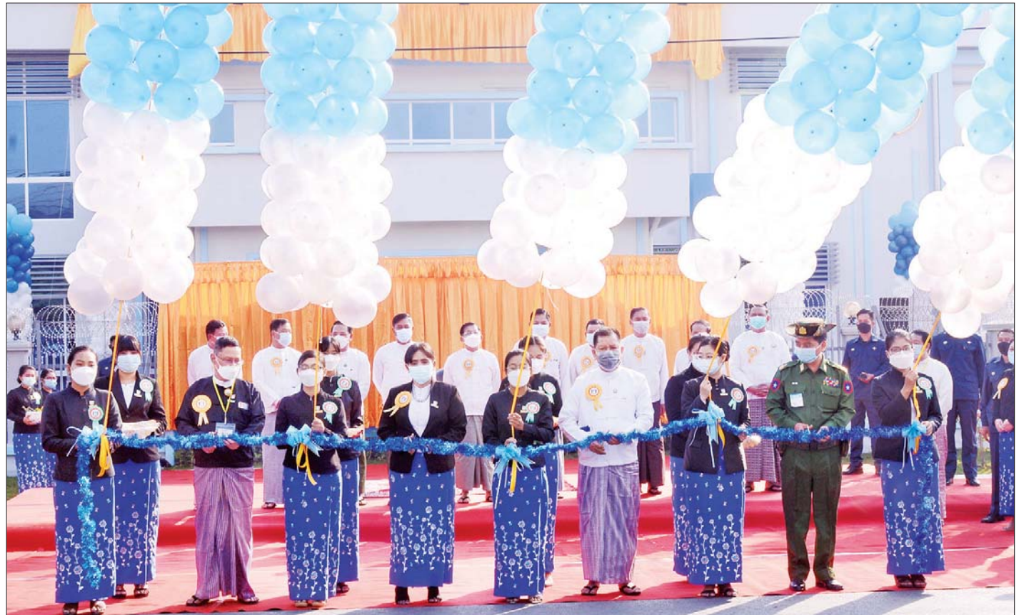
ပြည်ထောင်စုဝန်ကြီးနှင့် ပြည်ထောင်စုရှေ့နေချုပ် ဒေါက်တာ သီတာဦး၊ တိုင်းဒေသကြီးဝန်ကြီးချုပ် ဦးမောင်ကို၊ တိုင်းမှူး ဗိုလ်ချုပ် ကိုကိုဦးနှင့် တိုင်းဒေသကြီးဥပဒေချုပ် ဦးမြင့်အောင်တို့က မန္တလေးတိုင်းဒေသကြီး ဥပဒေချုပ်ရုံးသစ်အား ဖဲကြိုးဖြတ် ဖွင့်လှစ်ပေးစဉ်။

ယင်းနောက် နိုင်ငံတော်စီမံအုပ်ချုပ်ရေးကောင်စီဥက္ကဋ္ဌ၊ နိုင်ငံတော်ဝန်ကြီးချုပ် က မန္တလေးတိုင်းဒေသကြီး ဥပဒေချုပ်ရုံးနှင့် တရားလွှတ်တော်အဆောက်အအုံသစ်ဖွင့်လှစ်ခြင်းနှင့် ပတ်သက်၍ ပြောကြားရာတွင် နိုင်ငံတော်စီမံအုပ်ချုပ်ရေးကောင်စီသည် နိုင်ငံတော်တာဝန်အရပ်ရပ်ကို ဖွဲ့စည်းပုံအခြေခံဥပဒေနှင့်အညီ လွှဲပြောင်းရယူ ဆောင်ရွက်နေခြင်းဖြစ်ကြောင်း၊ ရှေ့လုပ်ငန်းစဉ် ၅ ရပ်နှင့် နိုင်ငံရေး၊ စီးပွားရေး၊ လူမှုရေး ဦးတည်ချက် ၉ ရပ်တို့ကို ချမှတ်၍ နိုင်ငံတော်တည်ငြိမ်အေးချမ်းရေး၊ ဖွံ့ဖြိုးတိုးတက်ရေးနှင့် တိုင်းရင်းသားပြည်သူများ၏ လူမှုစီးပွားဘဝများ တိုးတက်ဖြစ်ထွန်းရေးတို့ကို ဦးတည်ဆောင်ရွက်လျက်ရှိကြောင်း၊ ထိုသို့ဆောင်ရွက်ရာတွင် ခေတ်ကာလနှင့်လျော်ညီစေရန် အချို့သောဥပဒေများ၊ နည်းဥပဒေများကို ပြင်ဆင်ခြင်း၊ ဖျက်သိမ်းခြင်း၊ အစားထိုးဖြည့်စွက်ခြင်း၊ အသစ်ရေးဆွဲပြဋ္ဌာန်းခြင်းများ ပြုလုပ်ပေးလျက်ရှိကြောင်း။ စာမျက်နှာ ၄ သို့