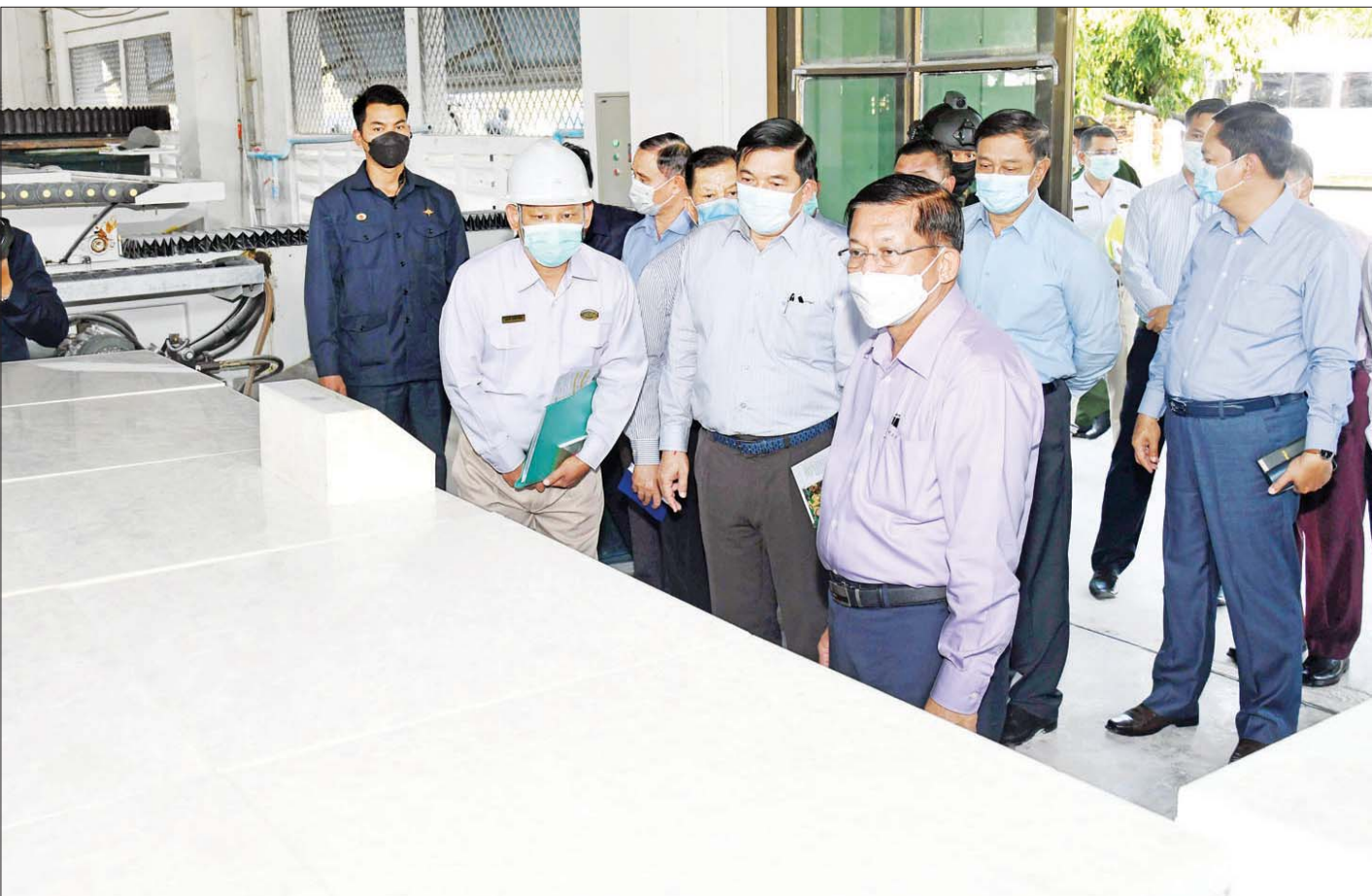
နိုင်ငံတော်စီမံအုပ်ချုပ်ရေးကောင်စီဥက္ကဋ္ဌ၊ တပ်မတော်ကာကွယ်ရေးဦးစီးချုပ် ဗိုလ်ချုပ်မှူးကြီး မင်းအောင်လှိုင် မန္တလေးတိုင်းဒေသကြီးရှိ မာဘယ်ကျောက်ပြားထုတ်လုပ်ရေးစက်ရုံ (မန္တလေး)လုပ်ငန်းဆောင်ရွက်မှု အခြေအနေများကို ကြည့်ရှုစစ်ဆေးစဉ်။

ချီးမြှင့်ငွေများပေးအပ် ဆက်လက်ပြီး နိုင်ငံတော်စီမံအုပ်ချုပ်ရေးကောင်စီဥက္ကဋ္ဌ၊ တပ်မတော်ကာကွယ်ရေးဦးစီးချုပ်နှင့် အဖွဲ့ဝင်များသည် မာဘယ်ကျောက်ပြားထုတ်လုပ်ရေးစက်ရုံ (မန္တလေး)သို့ ရောက်ရှိကြပြီး စက်ရုံအတွင်း နေပြည်တော်တွင် တည်ထားကိုးကွယ်မည့် မာရဝိဇယ ဗုဒ္ဓရုပ်ပွားတော်မြတ်ကြီး ပရိဝုဏ်တော်အတွင်းအသုံးပြုမည့် ကျောက်ပြားများနှင့် ကျောက်စာချပ်များ ထုတ်လုပ်နေမှုအခြေအနေ၊ မန္တလေးမဟာမြတ်မုနိဘုရားကြီးနှင့် ကုသိုလ်တော်ဘုရားကြီး ရင်ပြင်တော်တွင် ခင်းကျင်းမည့် နေပူခံကျောက်ပြားများ ထုတ်လုပ်နေမှုအခြေအနေနှင့် CNC Machine များကို အသုံးပြု၍ ဆင်းတုတော်များနှင့် ရုပ်တု၊ ရုပ်ထွင်းများ ထုတ်လုပ်နေမှုအခြေအနေများကိုကြည့်ရှုရာ မြန်မာစီးပွားရေးကော်ပိုရေးရှင်းဥက္ကဋ္ဌ ဒုတိယဗိုလ်ချုပ်ကြီး ညိုစောနှင့် စက်ရုံမှ တာဝန်ရှိသူများက လိုက်လံရှင်းလင်းတင်ပြကြသည်။ ရှင်းလင်းတင်ပြမှုများအပေါ် နိုင်ငံတော်စီမံအုပ်ချုပ်ရေးကောင်စီဥက္ကဋ္ဌ၊ တပ်မတော်ကာကွယ်ရေးဦးစီးချုပ်က လိုအပ်သည်များမှာကြားခဲ့ပြီး စက်ရုံဝန်ထမ်းများအတွက် ချီးမြှင့်ငွေများ ပေးအပ်ခဲ့ကြောင်း သတင်းရရှိသည်။