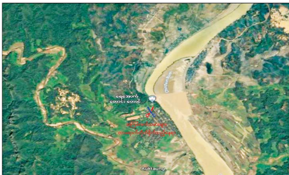
ဖောင်းပြင်မြို့နယ်အတွင်း လုံခြုံရေးဆောင်ရွက်နေသည့် မြန်မာနိုင်ငံရဲတပ်ဖွဲ့ဝင်များ၏ လုံခြုံရေး စခန်းများအား အကြမ်းဖက်သမားများ ဝင်ရောက်တိုက်ခိုက်သည့် နေရာပြပုံ