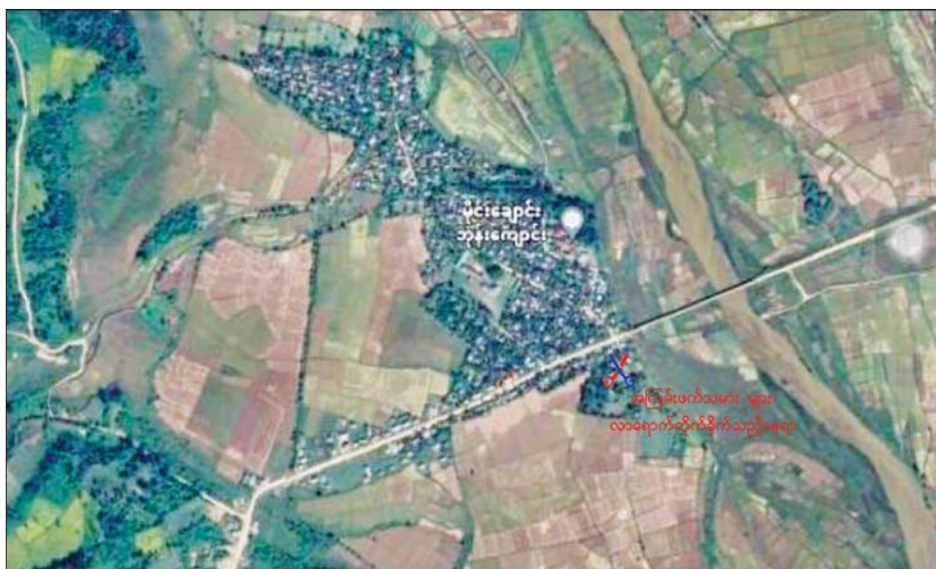
ဖောင်းပြင်မြို့နယ်အတွင်း လုံခြုံရေးဆောင်ရွက်နေသည့် မြန်မာနိုင်ငံရဲတပ်ဖွဲ့ဝင်များ၏ လုံခြုံရေး စခန်းများအား အကြမ်းဖက်သမားများ ဝင်ရောက်တိုက်ခိုက်သည့် နေရာပြပုံ