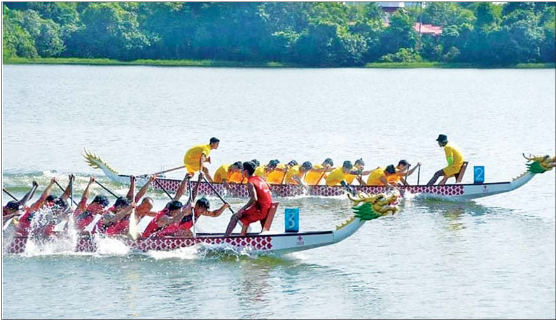
အင်းလျားကန်အတွင်း လှေလှော်အားကစားသမားများ လှေကျင့်နေစဉ်။