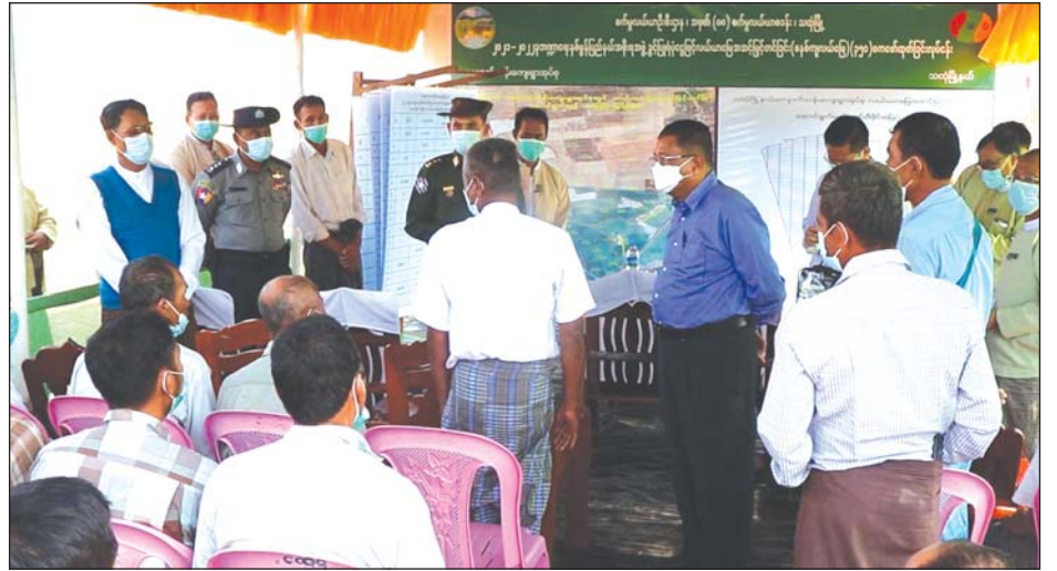
ပြည်နယ်ဝန်ကြီးချုပ်အား ဒေသခံတောင်သူများက လိုအပ်ချက်များ တင်ပြဆွေးနွေးစဉ်။

ပြည်နယ်ဝန်ကြီးချုပ်သည် အင်းရှည်ကျေးရွာတွင် စက်မှုနယ်မြေ (သထုံ) အကောင်အထည်ဖော်ရေးအတွက် ဆောင်ရွက်နေမှုများကိုလည်း ကြည့်ရှုစစ်ဆေးရာ ပြည်နယ်ဝန်ကြီးချုပ်အား စက်ရုံတာဝန်ခံက လက်ရှိ စက်ရုံအခြေအနေနှင့် ဆက်လက်ဆောင်ရွက်မည့် အခြေအနေများကို ရှင်းလင်းတင်ပြပြီး ပြည်နယ်ဝန်ကြီးချုပ်က မွန်ပြည်နယ်အတွင်း နိုင်ငံ