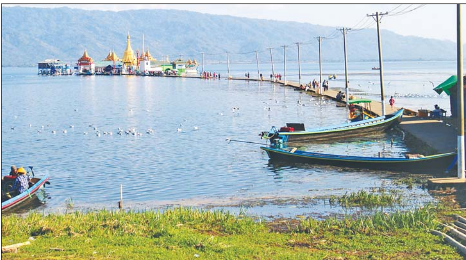
အင်းတော်ကြီးအင်းရေပြင်အတွင်းမှ ဆောင်းခိုငှက်များ။

ကို အင်းတော်ကြီးဘေးမဲ့တော ထိန်းသိမ်းစောင့်ရှောက်ရေးအဖွဲ့က ဆောင်းခိုငှက်များ စတင်ဝင်ရောက်ချိန်နှင့် ပြန်လည်ထွက်ခွာချိန်တွင် စာရင်းကောက်ယူလျက်ရှိပြီး ယခုနှစ် ဇန်နဝါရီလဆန်းပိုင်းစာရင်းကောက်ယူမှုများအရ အင်းတော်ကြီးဒေသ၌ ဆောင်းခိုငှက်မျိုးစိတ်ပေါင်း ၅၀ ကျော်ရှိပြီး ယခုနှစ် ဆောင်းရာသီတွင် ဝင်ရောက်ဆောင်းခိုသည့် ငှက်ကောင်ရေ နှစ်သောင်းကျော်မှတ်တမ်းပြုစုနိုင်ခဲ့ကာ အင်းတော်ကြီးကန်၏ ဆောင်းခိုငှက်မှတ်တမ်းတွင် မပါရှိသေးသည့် ငှက်မျိုးစိတ်အသစ် တစ်မျိုးကိုလည်း ယခုနှစ်တွင် စတင်တွေ့ရှိကြောင်း အင်းတော်ကြီးဘေးမဲ့တော ထိန်းသိမ်းစောင့်ရှောက်ရေးအဖွဲ့၏ မှတ်တမ်းများအရ သိရသည်။ ဝင်းနိုင်(ကချင်မြေ)