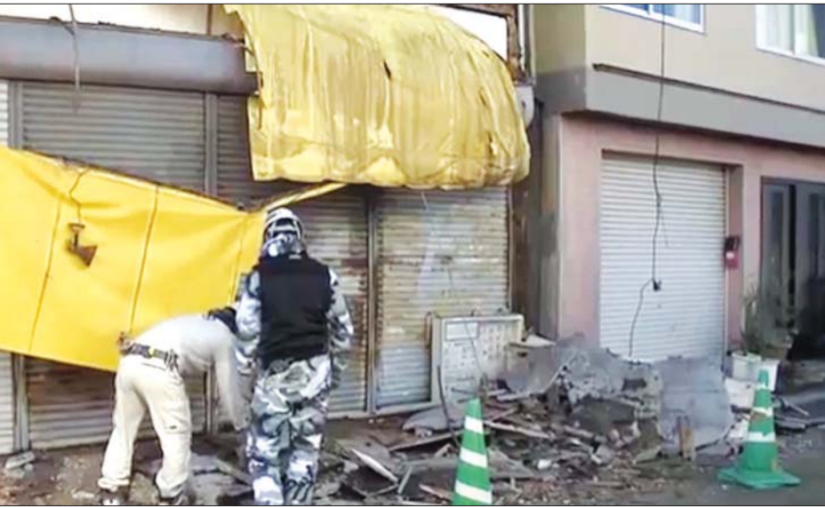
ငလျင်ကြောင့် ပျက်စီးနေမှုများကို တွေ့ရစဉ်။

တိုကျို ဇန်နဝါရီ ၂၂ ဂျပန်နိုင်ငံ အနောက်ပိုင်းတွင် အင်အားပြင်းထန်သည့် ငလျင် လှုပ်ခတ်ခဲ့ရာ အိုအိတာ၊ မီယာ ဇာကီ ၊ ကူမာမိုတိုနှင့် ကိုချိုခရိုင် တို့တွင် အပျက်အစီးကြီးမား ကြောင်း သိရသည်။ ဆူနာမီ သတိ ပေးချက် ထုတ်ပြန်ထားခြင်းမရှိ ကြောင်း သိရသည်။ ဇန်နဝါရီ ၂၂ ရက် ဒေသ စံတော်ချိန် နံနက် ၁ နာရီနှင့် ၈ မိနစ်တွင် ပြင်းအား ၆ ဒသမ ၆ မဂ္ဂနီကျုရှိ ငလျင်လှုပ်ခတ်ခဲ့ သည်။ ကျူရှုကမ်းရိုးတန်းကို ဦးတည်ကာ ငလျင်လှုပ်ခတ်ခဲ့ခြင်း ဖြစ်သည်ဟု ဂျပန်မိုးလေဝသ အေဂျင်စီက ပြောသည်။ လမ်းများ ပျက်စီးခြင်း၊ အဆောက်အအုံများ ပျက်စီး ခြင်းနှင့် ရေပိုက်များ ကွဲထွက်ခြင်း တို့ဖြစ်ပေါ်ခဲ့သည်ဟု ဒေသခံ