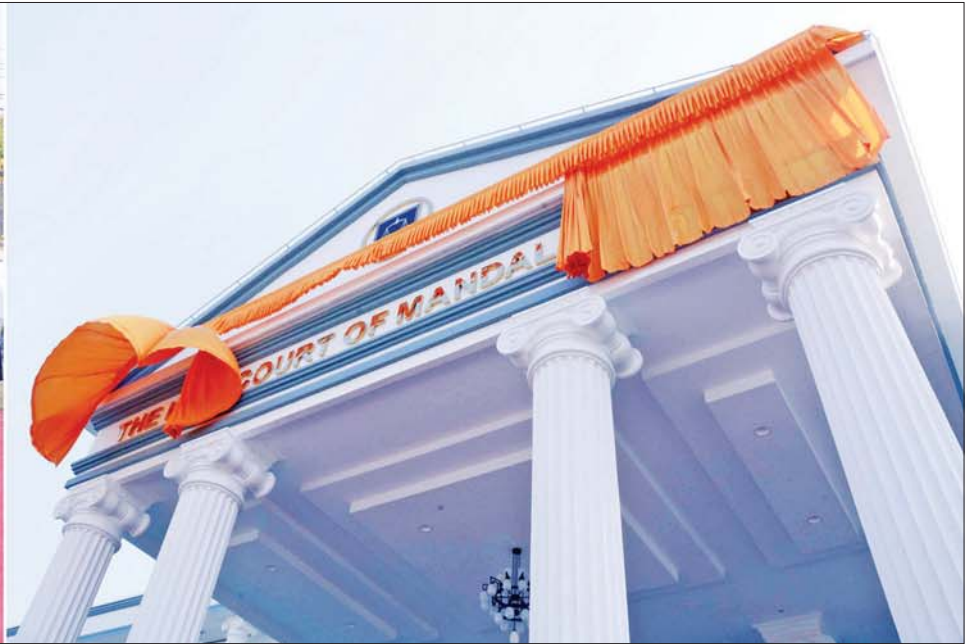
နိုင်ငံတော်စီမံအုပ်ချုပ်ရေးကောင်စီဥက္ကဋ္ဌ၊ နိုင်ငံတော်ဝန်ကြီးချုပ် ဗိုလ်ချုပ်မှူးကြီး မင်းအောင်လှိုင် မန္တလေးတိုင်းဒေသကြီး တရားလွှတ်တော်အဆောက်အအုံသစ် ဖွင့်ပွဲအခမ်းအနားတွင် တရားလွှတ်တော်ဆိုင်းဘုတ်အား စက်ခလုတ်နှိပ်ဖွင့်လှစ်ပေးစဉ်။