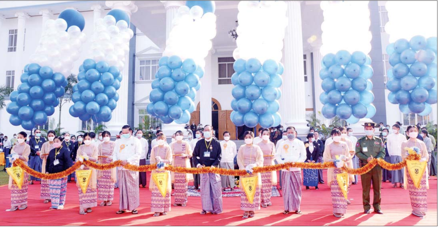
ပြည်ထောင်စုတရားသူကြီးချုပ် ဦးထွန်းထွန်းဦး၊ ပြည်ထောင်စုဝန်ကြီး ဦးရွှေလေး၊ တိုင်းဒေသကြီးဝန်ကြီးချုပ် ဦးမောင်ကို၊ တိုင်းမှူး ဗိုလ်ချုပ် ကိုကိုဦးနှင့် တိုင်းဒေသကြီး တရားလွှတ်တော်တရားသူကြီးချုပ် ဒေါ်ခင်သင်းဝေတို့က မန္တလေးတိုင်းဒေသကြီး တရားလွှတ်တော် အဆောက်အအုံသစ်အား ဖဲကြိုးဖြတ် ဖွင့်လှစ်ပေးစဉ်။

မျှမျှတတဆောင်ရွက်ရန်လို အဆောက်အအုံများ ဥပဓိရုပ်ကောင်းရန်လိုသကဲ့ သို့ တရားစီရင်ရေးနှင့် ဥပဒေရေးရာကဏ္ဍများတွင် မှန်မှန်ကန်ကန်၊ မြန်မြန်ဆန်ဆန်ဖြင့် မျှမျှတတ ဆောင်ရွက်ရန်လိုသည်ဟု ပြောကြားလိုကြောင်း၊ နိုင်ငံတော်အနေဖြင့် အဆောက်အအုံသစ်များကို တည်ဆောက်ပေးရသည့် ရည်ရွယ်ချက်သည် မြန်မာ နိုင်ငံတွင် မဏ္ဍိုင်ကြီးသုံးရပ်ဖြစ်သည့် ဥပဒေပြုရေး၊ အုပ်ချုပ်ရေးနှင့် တရားစီရင်ရေးကဏ္ဍများဆောင်ရွက် ရာ၌ ဂုဏ်သိက္ခာရှိစွာဖြင့် အောင်မြင်စွာဆောင်ရွက် နိုင်ရန်ဖြစ်ပြီး အရည်အချင်းပြည့်မီသည့် တရားရေး နှင့် ဥပဒေအရာရှိများကို ခန့်အပ်တာဝန်ပေးနိုင်ရေး အတွက်လည်းဖြစ်ကြောင်း၊ ထို့ပြင် တက္ကသိုလ် အသီးသီးမှ ဥပဒေဘွဲ့၊ ရာဇဝတ်ဥပဒေဘွဲ့၊ ပါရဂူဘွဲ့ ရ များကိုလည်း လုပ်ငန်းခွင်လက်တွေ့လုပ်ငန်း ပိုမို လေ့လာသင်ယူခွင့် အခွင့်အလမ်းရရှိစေရေးနှင့်