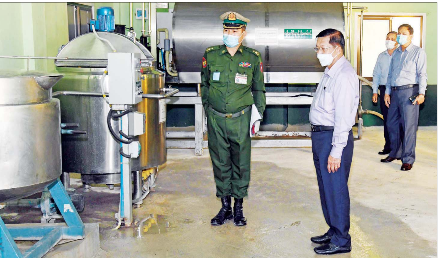
နိုင်ငံတော်စီမံအုပ်ချုပ်ရေးကောင်စီဥက္ကဋ္ဌ၊ တပ်မတော်ကာကွယ်ရေးဦးစီးချုပ် ဗိုလ်ချုပ်မှူးကြီး မင်းအောင်လှိုင် မန္တလေးတိုင်းဒေသကြီးရှိ နို့စားနွားမွေးမြူရေးစီမံကိန်း(ထုံးဘို) လုပ်ငန်းဆောင်ရွက်မှု အခြေအနေများကို ကြည့်ရှုစစ်ဆေးစဉ်။

လိုအပ်ချက်ပြည့်မီအောင် ထုတ်လုပ်နိုင်ရေးကြိုးပမ်းရှင်းလင်းတင်ပြမှုများအပေါ် နိုင်ငံတော်စီမံအုပ်ချုပ်ရေးကောင်စီဥက္ကဋ္ဌ၊ တပ်မတော်ကာကွယ်ရေးဦးစီးချုပ်က မွေးမြူရေးစခန်းများ ဆောင်ရွက်ရခြင်း၏ရည်ရွယ်ချက်သည် နယ်မြေခံတပ်မတော်သားများနှင့် ဒေသခံပြည်သူလူထုတို့ အသားငါးများကို ဈေးနှုန်းသက်သာစွာဖြင့် ပြည့်ပြည့်ဝဝ စားသောက်နိုင်စေရေးအတွက်ဖြစ်ပြီး အမြတ်အတွက် လုပ်ဆောင်နေခြင်းမဟုတ်ကြောင်း၊ သက်သာချောင်ချိရေးကို အဓိကထား စဉ်းစားဆောင်ရွက်ကြရမည်ဖြစ်ကြောင်း၊ မန္တလေးမြို့တွင် လူဦးရေတစ်သန်းခွဲခန့်ရှိပြီး နို့နှင့် နို့ထွက်ပစ္စည်းလိုအပ်ချက်၊ အသားလိုအပ်ချက်များကို တစ်ဖက်တစ်လမ်းမှ ဖြည့်ဆည်းဆောင်ရွက်ပေးနိုင်ရမည် ဖြစ်ကြောင်း၊