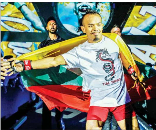
MMA ကစားသမား ထီရယ်လ်ထန်