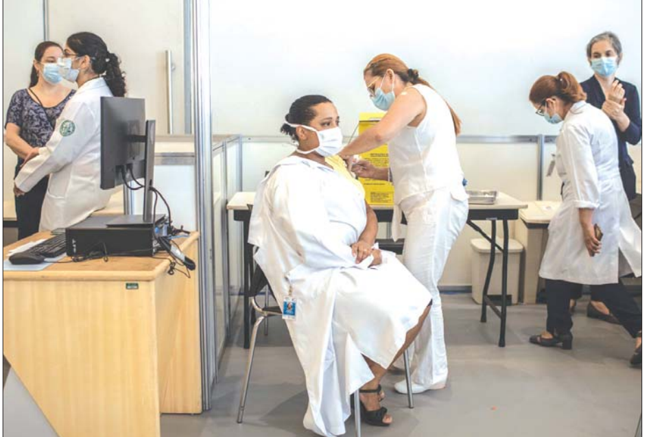
ဘရာဇီးနိုင်ငံ ဆော်ပိုလိုမြို့ရှိ ဆေးရုံတစ်ရုံတွင် ဆရာဝန်နှင့် သူနာပြုများ ကိုဗစ်- ၁၉ ကာကွယ်ဆေး ထိုးနှံမှုဆောင်ရွက်နေစဉ်။

ခြင်းကြောင့် မကြာမသေးမီ လများအတွင်း ကူးစက်ခံရမှုနှုန်း လျော့ကျခဲ့သည်။ ဘရာဇီးတွင် ကာကွယ်ဆေး ထိုးနှံမှုများကို အရှိန်အဟုန်ဖြင့် ပြုလုပ်ခဲ့သည်။ တရားဝင်စာရင်း ဇယားများအရ ဘရာဇီးနိုင်ငံတွင် လူပေါင်း ၁၆၂ ဒသမ ၆ သန်း (၇၅ ဒသမ ၇ ရာခိုင်နှုန်း)မှာ ကာကွယ်ဆေး အနည်းဆုံး တစ်ကြိမ် ထိုးပြီးသားဖြစ်သည်။ ကာကွယ်ဆေးအပြည့်ထိုးပြီးသူ ၁၄၈ ဒသမ ၁ သန်းရှိကြောင်း သိရ သည်။ ဆင်ဟွာ