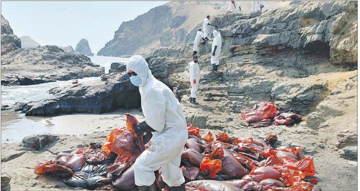
ကမ်းခြေတွင် သန့်စင်ရေးအတွက် လုပ်ဆောင်နေကြသည့် အကာအကွယ်ဝတ်စုံဝတ်ထားသော ဝန်ထမ်းများကို တွေ့ရစဉ်။

ရေနံယိုဖိတ်မှုဖြစ်ပေါ်နေသည့် နေရာများတွင် အတားအဆီး