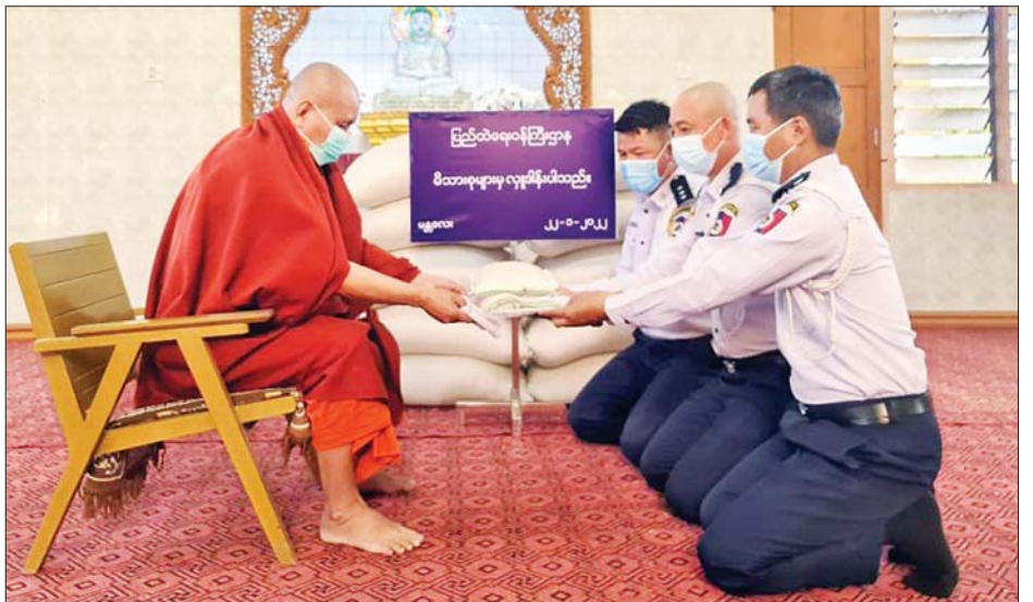
ပြည်ထဲရေးဝန်ကြီးဌာန တပ်ဖွဲ့ / ဦးစီးဌာနများမှ တာဝန်ရှိသူများက မြစ်ကြီးနားမြို့နှင့် မန္တလေးမြို့တို့ရှိ ဆရာတော်၊ သံဃာတော်များအား ဆွမ်းဆန်တော်များ ဆက်ကပ်လှူဒါန်းစဉ်။