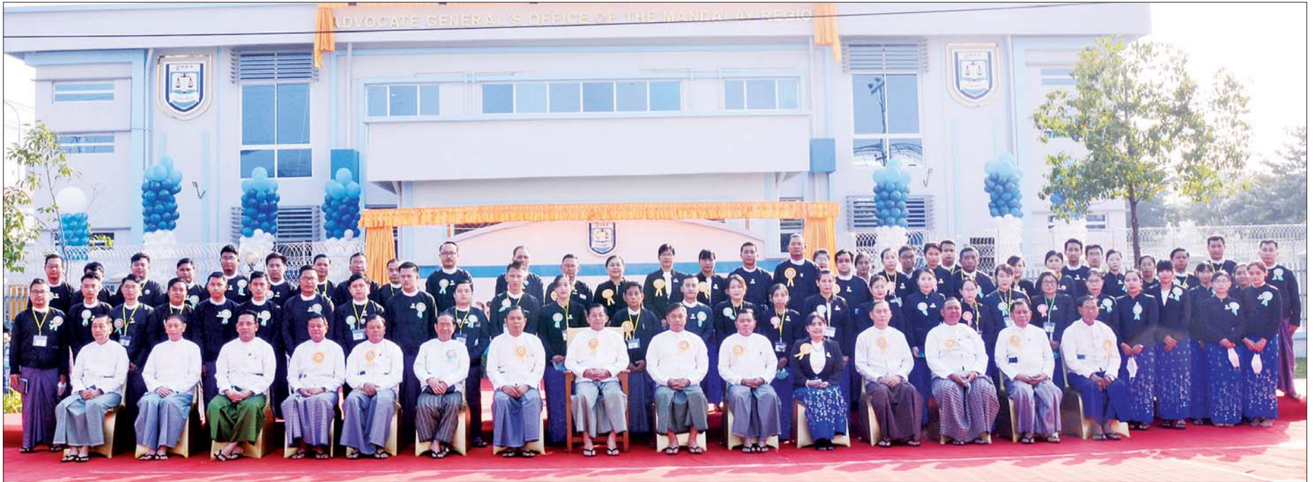
နိုင်ငံတော်စီမံအုပ်ချုပ်ရေးကောင်စီဥက္ကဋ္ဌ၊ နိုင်ငံတော်ဝန်ကြီးချုပ် ဗိုလ်ချုပ်မှူးကြီး မင်းအောင်လှိုင်နှင့် အဖွဲ့ဝင်များ မန္တလေးတိုင်းဒေသကြီး ဥပဒေချုပ်ရုံးအဆောက်အအုံ ဖွင့်ပွဲအခမ်းအနားတွင် တက်ရောက်လာကြသူများနှင့်အတူ စုပေါင်းမှတ်တမ်းတင် ဓာတ်ပုံရိုက်စဉ်။

အခမ်းအနားများသို့ နိုင်ငံတော်စီမံအုပ်ချုပ်ရေးကောင်စီအဖွဲ့ဝင်များဖြစ်ကြသည့် ဗိုလ်ချုပ်ကြီး တင်အောင်စန်း၊ ဒုတိယဗိုလ်ချုပ်ကြီး မိုးမြင့်ထွန်း၊ တွဲဖက်အတွင်းရေးမှူး ဒုတိယဗိုလ်ချုပ်ကြီး ရဲဝင်းဦး၊ ပြည်ထောင်စုတရားသူကြီးချုပ် ဦးထွန်းထွန်းဦး၊ ပြည်ထောင်စုဝန်ကြီးများဖြစ်ကြသည့် ဒေါက်တာ သီတာဦး၊ ဦးမောင်မောင်အုန်း၊ ဦးကိုကိုဦးခင်မောင်ရီ၊ ဦးအောင်သန်းဦး၊ ဦးမင်းသိန်းဇံ၊ မန္တလေးတိုင်းဒေသကြီး ဝန်ကြီးချုပ် ဦးမောင်ကို၊ ကာကွယ်ရေးဦးစီးချုပ် ရုံးမှ တပ်မတော်အရာရှိကြီးများ၊ အလယ်ပိုင်းတိုင်း စစ်ဌာနချုပ်တိုင်းမှူး၊ ဗိုလ်ချုပ် ကိုကိုဦး၊ မန္တလေး မြို့တော်ဝန်ကြီးကျော်ဆန်း၊ တိုင်းဒေသကြီးအစိုးရအဖွဲ့၊ တိုင်း၊ ခရိုင်၊ မြို့နယ်အဆင့် ဌာနဆိုင်ရာများမှ တာဝန်ရှိသူများ၊ ဖိတ်ကြားထားသူများ တက်ရောက်ကြသည်။