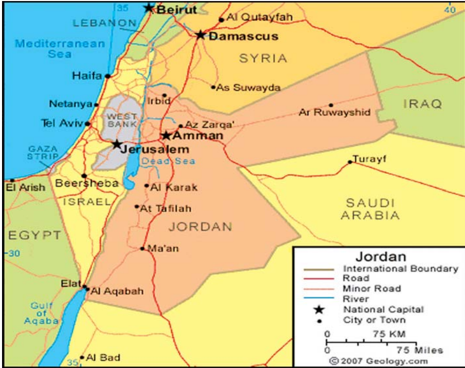
ဂျော်ဒန်နိုင်ငံ၏တည်နေရာပြမြေပုံ။

တရားရုံးများသည် မည်သည့်အာဏာမှ လွှမ်းမိုးမှုမရှိသော လွတ်လပ်သည့်အဖွဲ့အစည်းတစ်ရပ်