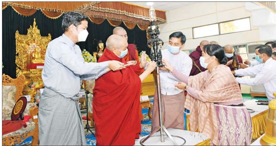
အဖွဲ့ဝင် အဂ္ဂမဟာပဏ္ဍိတ ဘဒ္ဒန္တ တော်၊ သံဃာတော်များ ကြွရောက် စစ်ဌာနချုပ် တိုင်းမှူး ဗိုလ်ချုပ် ကိုကိုဦးနှင့် အဖွဲ့ဝင်များ တက်

နေပြည်တော် ဇန်နဝါရီ ၁၉ မန္တလေးတိုင်းဒေသကြီး မန္တလေး မြို့ နန်းမြို့အတွင်း တည်ထား ကိုးကွယ်လျက်ရှိသည့် အာသောက စေတီမြတ်ကြီး စိန်ဖူးတော်၊ ငှက်မြတ်နားတော် ရွှေသင်္ကန်း ကပ်လှူပူဇော်ခြင်း မင်္ဂလာ အခမ်းအနားကို ယနေ့နံနက်ပိုင်း တွင် နန်းမြို့အတွင်းရှိ ရန်အောင် မြင်မ္ဗောရုံ၌ ပြုလုပ်ရာ ချမ်းမြ သာစည်မြို့နယ် မဟာဓမ္မိကာရာမ တိုက်၊ ရတနာပုံကျောင်း ဦးစီး ပဓာန နာယကဆရာတော် နိုင်ငံတော် သံဃမဟာနာယက