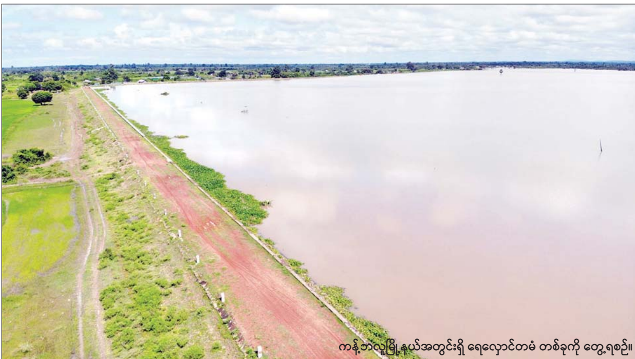
ကန့်ဘလူမြို့နယ်အတွင်းရှိ ရေလှောင်တံမံ တစ်ခုကို တွေ့ရစဉ်။

ကန့်ဘလူ ဇန်နဝါရီ ၁၉ သိန်ရင်ရေလှောင်တံမံ၊ မင်းမြင်ရေလှောင်တံမံ၊ ဖေဖော်ဝါရီ ဒုတိယပတ်တွင် စတင်ပေးဝေစစ်ကိုင်းတိုင်းဒေသကြီး ကန့်ဘလူမြို့နယ် လင်ပန်းရေလှောင်တံမံနှင့် လျှပ်စစ်ရေတင် မည်ဖြစ်ကြောင်း မြို့နယ်ဆည်မြောင်းနှင့် အတွင်းရှိ ကင်းတပ်ရေလှောင်တံမံ၊ ကျေးပင် လုပ်ငန်းတို့မှ နွေစပါး ဧက ၂၉၅၁၀ ကို ရေအသုံးချမှု စီမံခန့်ခွဲရေးဦးစီးဌာနမှ သိရအက်ရေလှောင်တံမံ၊ ပေကြီးရေလှောင်တံမံ၊ အောင်မြင်စွာ စိုက်ပျိုးနိုင်ရေး ဆည်ရေများကို သည်။ စာမျက်နှာ ၁၁ ကော်လံ ၁၀