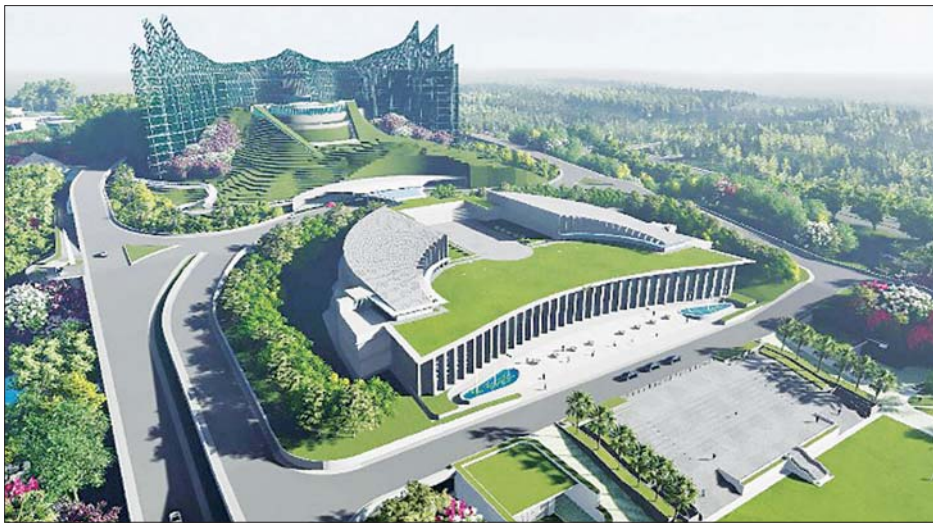
ကလီမန်တန်တွင် တည်ဆောက်မည့် မြို့သစ်ပုံစံငယ်ကို တွေ့ရစဉ်။

ယခင်သမ္မတများသည် မြို့တော်ကို ရွှေ့ပြောင်းရန် စိတ်ကူးရှိခဲ့သည်။ ဂျိုကိုဝီဒို လူသိများသည့် အင်ဒိုနီးရှားသမ္မတသည် ကိစ္စရပ်အတော်များများကြောင့် မြို့တော်ကို ကလီမန်တန်အရှေ့ပိုင်းသို့ ရွှေ့ပြောင်းရန် လွန်ခဲ့သော သုံးနှစ်က ကတိပြုခဲ့သည်။ အဆိုပါကိစ္စရပ်များထဲတွင် လူဦးရေသိပ်သည်းဆများလာခြင်းနှင့် လူဦးရေ ၁၀ သန်းကျော်နေထိုင်သော ဂျကာတာသည် ယခင်ထက် မြေနေရာနိမ့်ကျလာခြင်း စသည့်အကြောင်းများကြောင့် ထိုသို့ရွှေ့ပြောင်းရန် စိတ်ချခဲ့ခြင်းဖြစ်သည်။