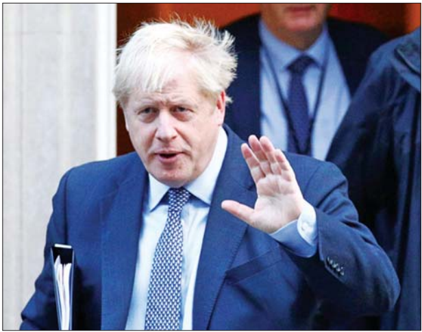
ဗြိတိန်ဝန်ကြီးချုပ် ဘောရစ်ဂျွန်ဆင်။

အကြံပေး ဒိုမီနစ်ကန်နင်းက သူသည် ဂျွန်ဆင်ကို ပါတီပွဲသို့ တက်ရောက်ခဲ့သည့် ကိစ္စနှင့် ပတ်သက်ပြီး သတိပေးခဲ့ကြောင်း တွစ်တာတွင် ဖော်ပြခဲ့သည်။