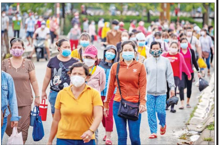
ဗီယက်နမ်တွင် ကိုဗစ်-၁၉ ကူးစက်ဖြစ်ပွားမှု ကာကွယ်ရန် ပါးစပ် နှာခေါင်းစည်း တပ်ဆင်သွားလာနေသူများကို တွေ့ရစဉ်။

ဇန်နဝါရီ ၁၈ ရက်အထိ ဗီယက်နမ်နိုင်ငံတွင် ကိုဗစ်-၁၉ ကူးစက်ဖြစ်ပွားသူ ၂၀၆၂၁၈ ဦးရှိပြီး နှစ်သန်းကျော်မှာ