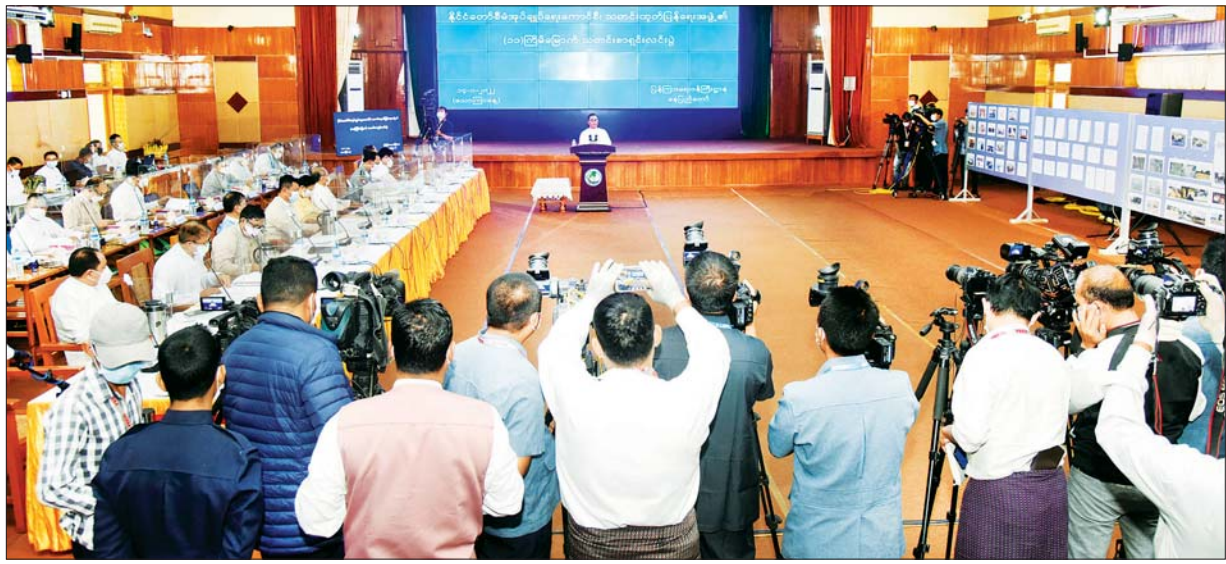
ဇန်နဝါရီ ၁၄ ရက်က နိုင်ငံတော်စီမံအုပ်ချုပ်ရေးကောင်စီ၊ သတင်းထုတ်ပြန်ရေးအဖွဲ့၏ (၁၁) ကြိမ်မြောက် သတင်းစာရှင်းလင်းပွဲ ကျင်းပစဉ်။

ပြည်ထောင်စုစိတ်ဓာတ် ပိုမိုရှင်သန်နိုင်စေရေး ဗိုလ်ချုပ် ဇော်မင်းထွန်းက ငြိမ်းချမ်းရေးအတွက် ခြေလှမ်းသစ် ဟုဆိုရာတွင် ပထမဆုံးငြိမ်းချမ်းရေးအတွက် NCA လက်မှတ်ရေးထိုး နိုင်အောင် စတင်လာသည့် အခြေအနေများကို မိမိပြောကြားပြီး ဖြစ်ကြောင်း၊ NCA လက်မှတ်ရေးထိုးနိုင်အောင် ရှေ့တွင်စခဲ့သည့် လုပ်ငန်းများက အများကြီးရှိကြောင်း၊ ယင်းနှင့်ပတ်သက်ပြီး တွေ့ဆုံ ဆွေးနွေးမှုများ ပြုလုပ်နေသည့် အကြိမ်ရေများကို ပြောပြီးဖြစ်ကြောင်း၊ ယင်းသို့ တွေ့ဆုံဆွေးနွေးမှုများကို ဆက်လက်လုပ်ဆောင်သွားမည် ဖြစ်ကြောင်း၊ ထိုမှတစ်ဆင့် ပစ်ခတ်တိုက်ခိုက်မှုရပ်စဲရေး အဆင့်တစ်ခု ရောက်အောင်၊ bilateral ထိုးနိုင်သည့်အဆင့်တစ်ခုရောက်အောင် ဆောင်ရွက်သွားမည်ဖြစ်ကြောင်း၊ စာမျက်နှာ ၁၇ သို့