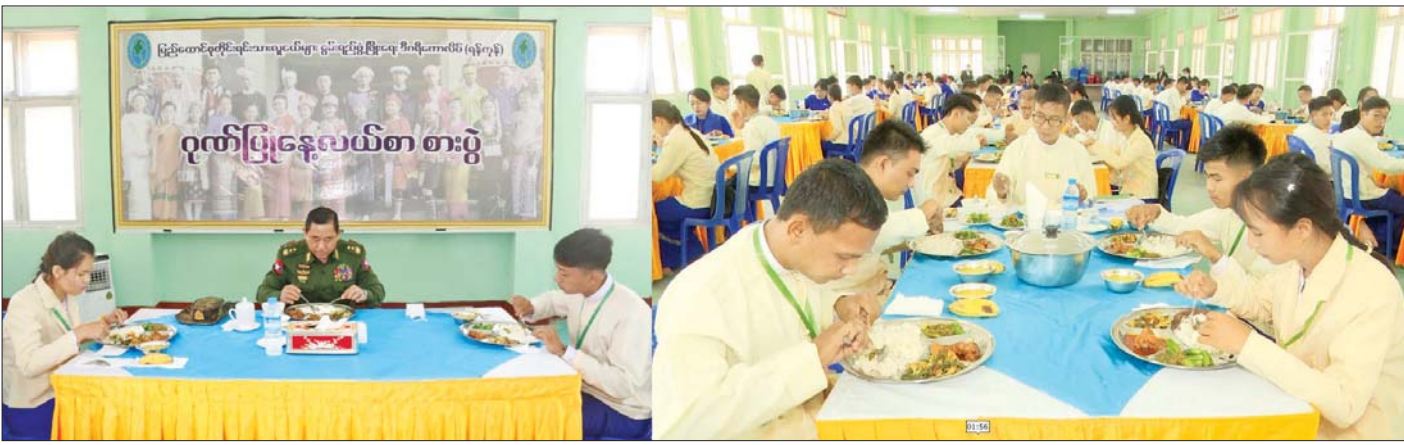
ပြည်ထောင်စုဝန်ကြီး ဒုတိယဗိုလ်ချုပ်ကြီး ထွန်းထွန်းနောင် ပြည်ထောင်စုတိုင်းရင်းသားလူငယ်များ စွမ်းရည်ဖွံ့ဖြိုးရေးဒီဂရီ ကောလိပ် (ရန်ကုန်)၌ ကျောင်းအုပ်ကြီး၊ ပါမောက္ခ/ ဌာနမှူးများ၊ ဝန်ထမ်းများနှင့် ကျောင်းသား ကျောင်းသူများနှင့်အတူ နေ့လယ်စာ သုံးဆောင်စဉ်။

နေပြည်တော် ဇန်နဝါရီ ၁၉ နယ်စပ်ရေးရာဝန်ကြီးဌာန ပြည်ထောင်စုဝန်ကြီး ဒုတိယဗိုလ်ချုပ်ကြီး ထွန်းထွန်းနောင်သည် ဇန်နဝါရီ ၁၇ ရက် မွန်းလွဲပိုင်းတွင် ရန်ကုန်တိုင်းဒေသကြီး လှည်းကူးမြို့နယ် ညောင်နစ်ပင် စိုက်ပျိုးမွေးမြူရေး အထူးဇုန် (၃)၌ ပြည်ထောင်စုတိုင်းရင်းသားလူငယ်များ စွမ်းရည်ဖွံ့ဖြိုးရေးဒီဂရီကောလိပ် (ရန်ကုန်)၊ ဗဟိုလေ့ကျင့်ရေးကျောင်းတို့မှ ကျောင်းသားကျောင်းသူများ၊ သင်တန်းသား၊ သင်တန်းသူများနှင့် ဝန်ထမ်းများ၊ ဝန်ထမ်းမိသားစုဝင်များ၏ စားသောက်ရေးနှင့် သက်သာချောင်ချိရေး အထောက်အကူဖြစ်စေရန်အတွက် စိုက်ပျိုးမွေးမြူရေးလုပ်ငန်းများ ဆောင်ရွက်မည့် မြေနေရာကို ကြည့်ရှုစစ်ဆေးခဲ့ပြီး ဆက်လက်ဆောင်ရွက်ရမည့် လုပ်ငန်းများနှင့်ပတ်သက်၍ ပေါင်းစပ်ညှိနှိုင်း မှာကြားသည်။