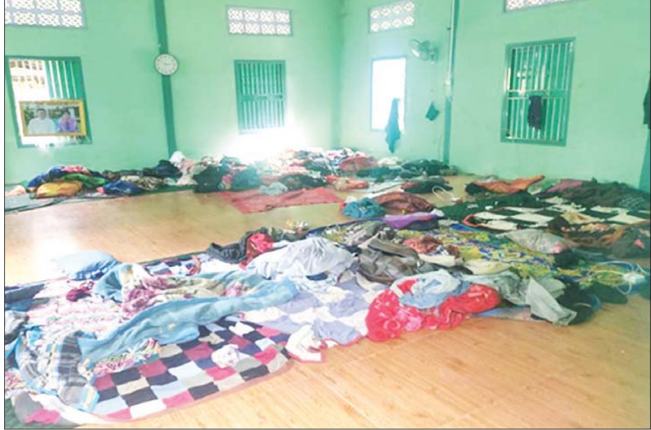
ဘုန်းကြီးကျောင်းအတွင်း အကြမ်းဖက်သူများနေထိုင်သည့် နေရာကို တွေ့ရစဉ်။