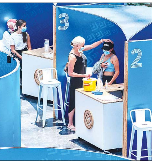
တောင်အာဖရိကနိုင်ငံ ဂျီဟန်နက်စ်ဘတ်မြို့ ကာကွယ်ဆေးထိုးပေးရာနေရာတစ်ခုကို တွေ့ရစဉ်။ အပါအဝင် အခြားသောနိုင်ငံများ ပေးခဲ့သည်။ သည် ယင်းပိတ်ဆို့မှုကိုဖယ်ရှား အင်န်အိတ်ချီကေ

ယခင် အကျော့များနှင့် နှိုင်းယှဉ်လျှင် အိုမီခရွန်ကြောင့် သေဆုံးမှုနှင့် ဆေးရုံတက်ရမှုမှာ လျော့ကျသည်။ ခရစ္စမတ်ကာလ အားလပ်ရက်တွင် ရောဂါကူးစက်မှုများလာခြင်း ရှိမရှိ အရာရှိများက အနီးကပ်စောင့်ကြည့်နေသော်လည်း နောက်ထပ် ကူးစက်ခံရမှုများ လျော့ကျလာသည်ကို တွေ့မြင်ရကြောင်း ကမ္ဘာ့ကျန်းမာရေး အဖွဲ့ကြီးမှ အာဖရိကဆိုင်ရာ ဒေသတွင်း အရာရှိတစ်ဦးက ပြောသည်။ ဥရောပအပါအဝင် အချို့သောနိုင်ငံများမှာ အိုမီခရွန်ကူးစက်မှု စတင်ပေါ်ပေါက်လာစဉ်က အာဖရိကနိုင်ငံများကို ပြည်ဝင်ခွင့် ပိတ်ပင်ခဲ့သည်။ သို့သော်လည်း တစ်ကမ္ဘာလုံးအနှံ့ ဗိုင်းရပ်စ်ကူးစက်ပျံ့နှံ့သွားသည့်အခါ ဗြိတိန်နှင့် အမေရိကန်