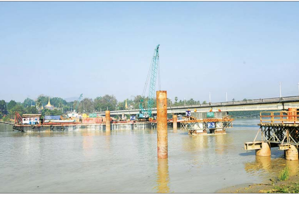
နိုင်ငံတော်စီမံအုပ်ချုပ်ရေးကောင်စီဥက္ကဋ္ဌ၊ နိုင်ငံတော်ဝန်ကြီးချုပ် ဗိုလ်ချုပ်မှူးကြီး မင်းအောင်လှိုင် ထားဝယ် - ကမြောက်ကင်း - လောင်းလုံး လမ်းပေါ်ရှိ ကမြောက်ကင်းတံတား တည်ဆောက်နေမှုကို ကြည့်ရှုစစ်ဆေးစဉ်။