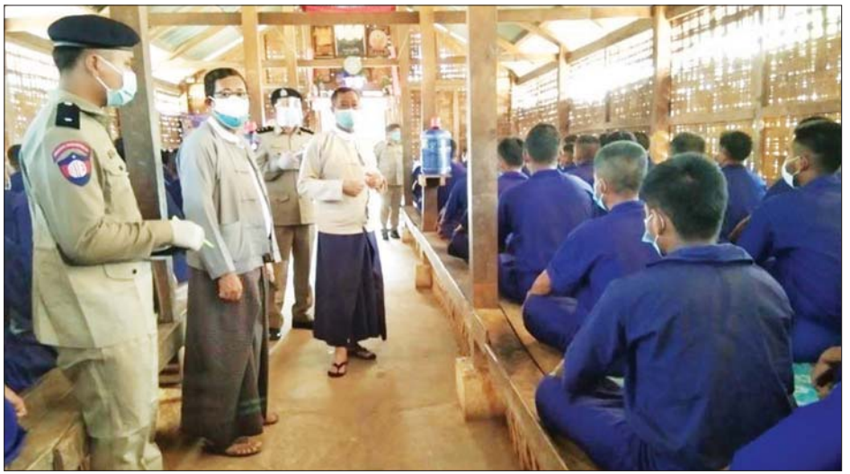
ကာကွယ်ရေးနှင့်စပ်လျဉ်း၍ ဆောင်ရွက်ထားရှိမှုနှင့် ကိုဗစ်-၁၉ ရောဂါ ကာကွယ်ဆေးထိုးနှံပြီးစီးမှုတို့ကို ကြည့်ရှုစစ်ဆေးသည်။ ယင်းအဖွဲ့၏ ခရီးစဉ်အတွင်း စစ်ဆေးတွေ့ရှိချက် အပေါ် အခြေခံ၍ လိုအပ်သလို စိစစ်ဆောင်ရွက်ပေး နိုင်ရေးအတွက် အကြံပြုချက်များကို သက်ဆိုင်ရာ ဌာနများသို့ ပေးပို့သွားမည်ဖြစ်ကြောင်း သိရ သည်။ သတင်းစဉ်

အထည်ဖော် ဆောင်ရွက်ပြီးစီးမှုတို့ကို ကြည့်ရှု စစ်ဆေးသည်။ အကျဉ်းထောင်နှင့် ကုန်ထုတ်စခန်းများကို ဝင်ရောက်ကြည့်ရှုစစ်ဆေးစဉ် အကျဉ်းသား/ အချုပ် သားများ၏ အိပ်ဆောင်များ၊ တိုက်ခန်းများ၊ ဆေးရုံ ဆောင်၊ စာကြည့်တိုက်၊ စားဖိုကြီး၊ ရိက္ခာစတို၊ သောက်ရေသန့်စက်နှင့် သုံးရေကန်များ၊ မိလ္လာများကို လည်းကောင်း၊ ရဲစခန်းအချုပ်ခန်းများကို ကြည့်ရှု စစ်ဆေးစဉ် အချုပ်ခန်းအတွင်း သန့်ရှင်းရေး၊ မိလ္လာ များ သန့်ရှင်းရေးနှင့် သောက်သုံးရေသုံးစွဲမှု၊ လိုအပ် သည့် ဆေးဝါးများနှင့် ထားရှိသည့် ဆေးကိရိယာ ပစ္စည်းများ လုံလောက်စွာရရှိမှုနှင့် ကိုဗစ်-၁၉ ရောဂါ