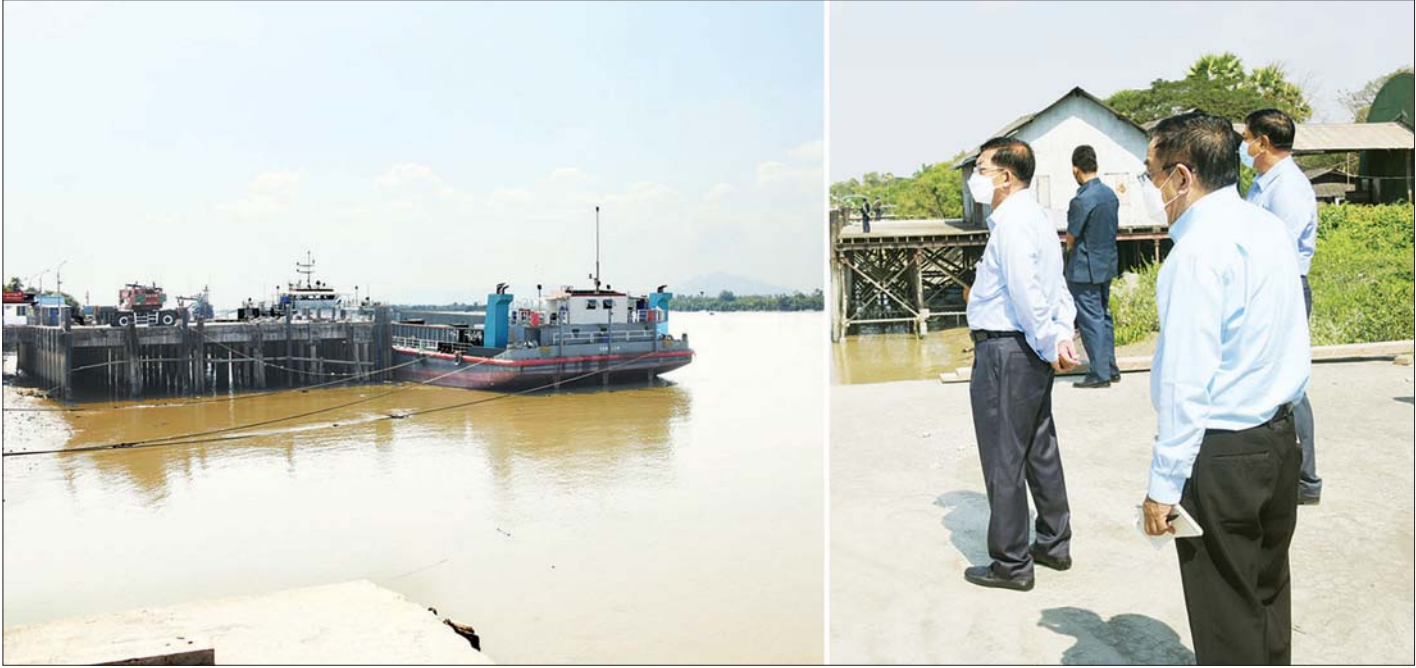
နိုင်ငံတော်စီမံအုပ်ချုပ်ရေးကောင်စီဥက္ကဋ္ဌ၊ နိုင်ငံတော်ဝန်ကြီးချုပ် ဗိုလ်ချုပ်မှူးကြီး မင်းအောင်လှိုင် ထားဝယ်မြို့၊ ကြက်စားပြင်ရပ်ကွက်ရှိ မြန်မာ့ဆိပ်ကမ်းအာဏာပိုင် ဆိပ်ခံတံတားအား ကြည့်ရှုစစ်ဆေးစဉ်။

တက္ကသိုလ်တွင် ပညာသင်ကြားပေးနေသည့် ဆရာ၊ ဆရာမများအနေဖြင့် ကျောင်းသား၊ ကျောင်းသူများကို စာပေပညာ၊ အတတ်ပညာတို့တွင် စိတ်ပါဝင်စားမှုရှိရန်၊ အမှန်တကယ် တတ်မြောက်အောင် သင်ကြားပေးရန်လိုကြောင်း၊ အလွတ်ကျက်ပညာရေး သဘောမျိုးမဟုတ်ဘဲ သင်ယူလေ့လာခြင်း Study စနစ်ဖြင့် သင်ကြားမှုစနစ်ဖြစ်ရန်လိုပြီး ဆရာနှင့် ကျောင်းသား အပြန်အလှန် မေးမြန်းဆွေးနွေးခြင်း၊ ကျောင်းသား၊ ကျောင်းသူများအနေဖြင့် သက်ဆိုင်ရာ စာပေဘာသာပညာရပ်များကို လေ့လာဖတ်ရှုမှတ်သားခြင်းတို့ လုပ်ဆောင်စေရမည်ဖြစ်ကြောင်း၊ ကျောင်းသား၊ ကျောင်းသူများ စိတ်ချမ်းမြေ့စွာ၊ စိတ်ကြည်နူးချမ်းသာမှုရှိစွာဖြင့် ပညာသင်ယူနိုင်ရေးအတွက်လည်း ကျောင်းပရိဝုဏ်အတွင်း