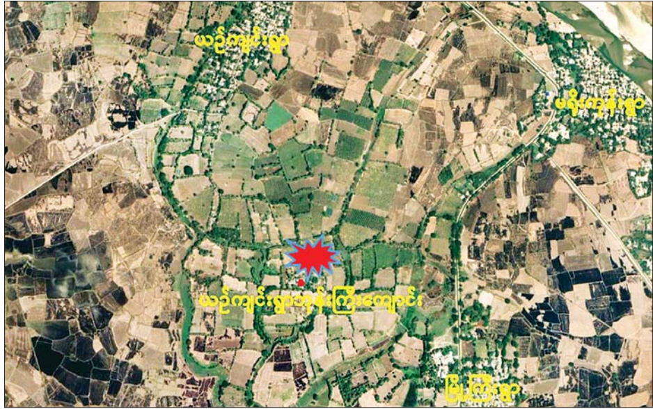
ရေဦးမြို့နယ်အတွင်း အဖျက်အမှောင့်လုပ်ငန်းများ ဆောင်ရွက်ရန် ယဉ်ကျေးကျေးရွာဘုန်းတော်ကြီး ကျောင်းသို့ ရောက်ရှိနေသည့် အကြမ်းဖက်သမားများအား ဝင်ရောက်ဖမ်းဆီးသည့်နေရာပြပုံ။

အကြမ်းဖက်လုပ်ငန်းများ လုပ် ဆောင်ရန်အတွက် အသုံးပြုမည့် လက်နက်/ ခဲယမ်းများကို နည်း မျိုးစုံဖြင့် နိုင်ငံအတွင်းပို့ဆောင်၍ အများပြည်သူ ယုံကြည်ကိုးကွယ် ရာဖြစ်သော ဘုန်းတော်ကြီး ကျောင်းအချို့အတွင်း သိုဝှက် သိမ်းဆည်းခြင်း၊ စခန်းချနေထိုင် ခြင်းများကိုလုပ်ဆောင်၍ ဘာသာ၊ သာသနာတော် ညှိုးနွမ်းပျက်စီး ပပျောက်ရေးကို ဦးတည် လုပ်ဆောင်လျက်ရှိရာ ကိုးကွယ် ယုံကြည်ရာဘာသာဝင်များ အနေ ဖြင့် အသိတရားလက်ကိုင်ထား၍ သက်ဆိုင်ရာ အဖွဲ့အစည်းများ၏ ဖော်ထုတ်ဖမ်းဆီးရေးယူဆောင် ရွက်နေမှုများအပေါ် အထောက် အကူရရှိစေရန် အကြမ်းဖက် သမားများ၏ သတင်းများကို ရရှိ