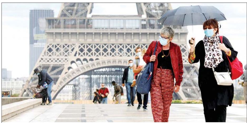
ပြင်သစ်နိုင်ငံ ပါရီမြို့တွင် ပါးစပ်၊ နှာခေါင်းစည်းတပ်ဆင်ကာ သွားလာနေကြသူများကို တွေ့ရစဉ်။ နိုင်ငံတွင် တတိယအကြိမ်ကာကွယ်ဆေးထိုးပြီးပါက အလား ကန့်သတ်ထားမည်ဟု သိရသည်။ ရောဂါကူးစက်ခံရလျှင်လည်း ခုနစ်ရက်သာ အသွား အင်န်အိတ်ချီကေ

ကိုဗစ် -၁၉ ကူးစက်ခံထားရသူနှင့် ထိတွေ့မိသော်လည်း ကာကွယ်ဆေးနှစ်ကြိမ်ထိုးပြီးပါက အသွားအလာ ကန့်သတ်မှုခံယူရန် မလိုအပ်ပေ။ သို့သော်လည်း ဆေးစစ်မှုကိုမူ ပြုလုပ်ရမည်ဖြစ်သည်။ ဂျာမနီနိုင်ငံတွင်လည်း ကိုဗစ် -၁၉ ကူးစက်ခံရပြီးနောက်တစ်ပတ်အကြာတွင် ရောဂါပျောက်ကင်းပါက အသွားအလာကန့်သတ်မှု ခံယူရန် မလိုအပ်တော့ဟု သိရသည်။ ရောဂါရှိသူနှင့်ထိတွေ့မိသူများတွင် တတိယအကြိမ်ကာကွယ်ဆေးထိုးထားပါက ခြွင်းချက်အနေဖြင့် အသွားအလာကန့်သတ်မှုခံယူရန် မလိုအပ်ဟု သိရသည်။ လျှော့ချခဲ့ အီတလီနိုင်ငံတွင်လည်း သီးခြားထားကန့်သတ်ထားသည့်အချိန်ကာလကို လျှော့ချခဲ့သည်။ အီတလီ