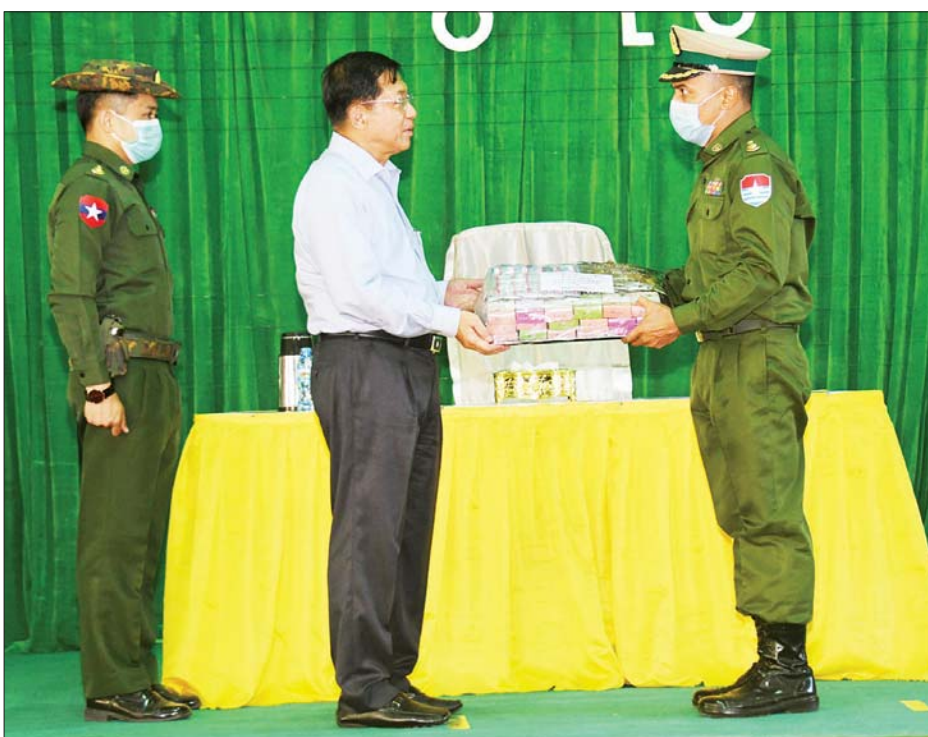
နိုင်ငံတော်စီမံအုပ်ချုပ်ရေးကောင်စီဥက္ကဋ္ဌ၊ တပ်မတော်ကာကွယ်ရေးဦးစီးချုပ် ဗိုလ်ချုပ်မှူးကြီး မင်းအောင်လှိုင် အရာရှိ၊ စစ်သည်၊ မိသားစုများအတွက် စားသောက်ဖွယ်ရာပစ္စည်းများကို ပေးအပ်ရာ ခေတ္တတပ်နယ်မှူးက လက်ခံရယူစဉ်။

တိုက်တွန်းချက်နှင့် တားမြစ်ချက်များ စစ်စည်းကမ်းသည် တိုက်တွန်းချက်နှင့် တားမြစ်ချက်များပင်ဖြစ်ပြီး မဖြစ်သင့်သည်များကို မဖြစ်စေရန်၊ စည်းကမ်းကျန်ပြီး စစ်သားပီသသည့် နေထိုင်