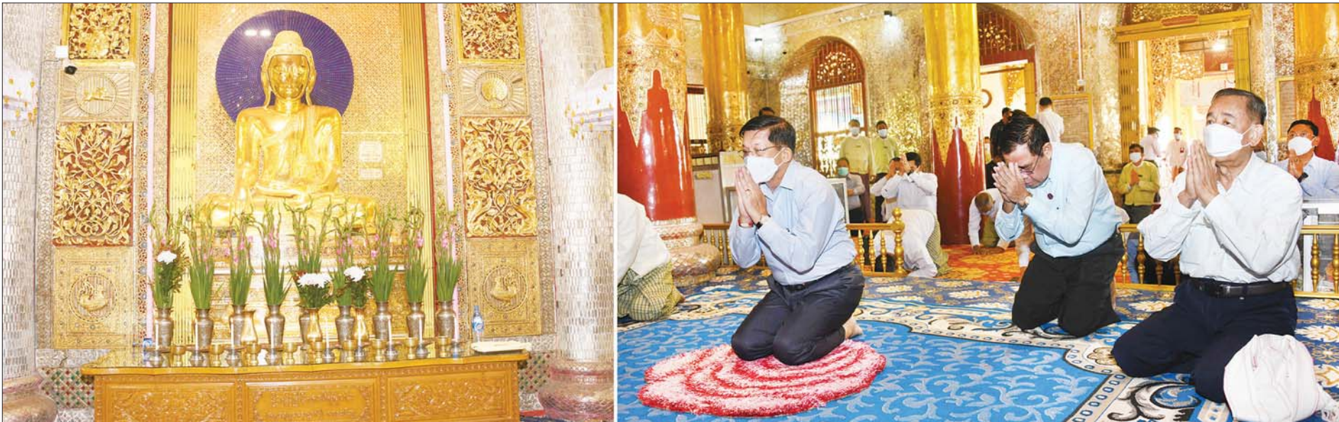
နိုင်ငံတော်စီမံအုပ်ချုပ်ရေးကောင်စီဥက္ကဋ္ဌ၊ နိုင်ငံတော်ဝန်ကြီးချုပ် ဗိုလ်ချုပ်မှူးကြီး မင်းအောင်လှိုင် ထားဝယ်မြို့ကျက်သရေဆောင် လောကမာရဇိန် ရုပ်ပွားတော်မြတ်ကြီးအား ဖူးမြော်ကြည်ညိုစဉ်။