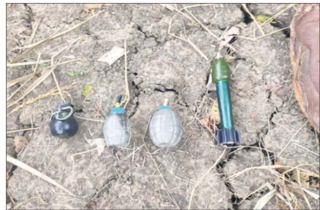
သိမ်းဆည်းရမိသည့် လက်နက်/ခဲယမ်းများ။