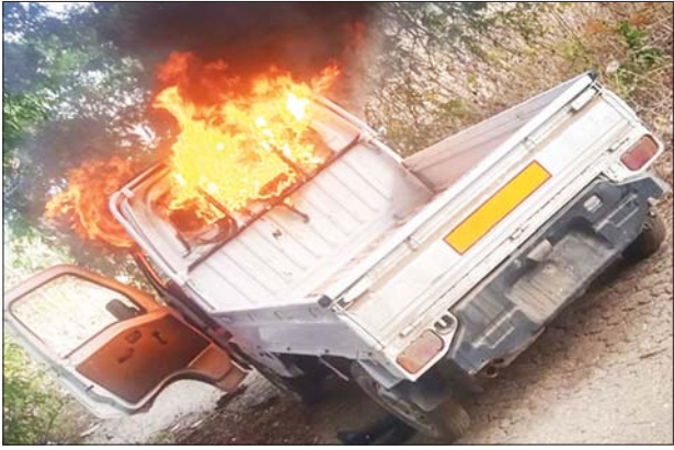
အကြမ်းဖက်သူများအသုံးပြုသည့် မော်တော်ယာဉ်နှင့် ဆိုင်ကယ်များကို တွေ့ရစဉ်။