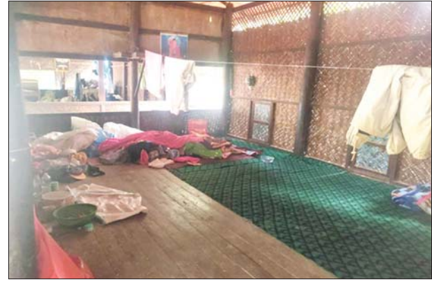
ဘုန်းကြီးကျောင်းအတွင်း အကြမ်းဖက်သူများနေထိုင်သည့် နေရာကို တွေ့ရစဉ်။