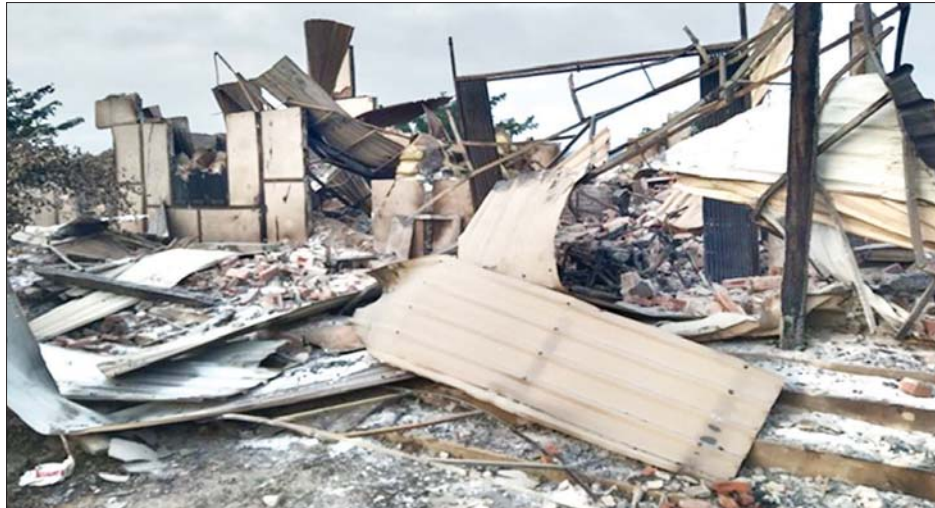
ထီးချိုင့်မြို့နယ် မရသိမ် အ.လ.က(ခွဲ) စာသင်ကျောင်း မီးလောင်ကျွမ်းမှု မှတ်တမ်းဓာတ်ပုံ။

ဆောင်ရွက်နေစဉ် ဇန်နဝါရီ ၁၃ ရက် ည ၉ နာရီခွဲခန့်တွင် ကျေးရွာအတွင်း ပြန်လည်ဝင်ရောက်လာပြီး ၎င်းတို့ စခန်းချ အခြေပြုနေထိုင်ခဲ့သည့် သက်သေအထောက်အထားများ မကျန်စေရန်အတွက် စာသင်ကျောင်းကို ဆင်ခြင်တုံတရားမဲ့စွာ မီးရှို့ဖောက်ခွဲဖျက်ဆီးခဲ့သည်။ ယင်းသို့ မီးရှို့ဖောက်ခွဲဖျက်ဆီးခဲ့မှုကြောင့် ကျေးရွာရှိ အလျားပေ ၁၃၀၊ အနံ ၂၅ ပေ၊ အမြင့် ၂၅ ပေရှိ ပေ ၃၀ ပတ်လည် အခန်းလေးခန်းပါ နှစ်ထပ်စာသင်ဆောင်