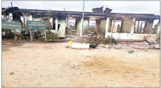
အလျားပေ ၆၀၊ အနံ ၂၅ ပေ၊ အမြင့် ၁၅ ပေ၊ ပေ ၂၀ ပတ်လည် အခန်း သုံးခန်းပါ တစ်ထပ်ကျောင်းဆောင် မီးလောင်ကျွမ်းမှု မှတ်တမ်းဓာတ်ပုံ။