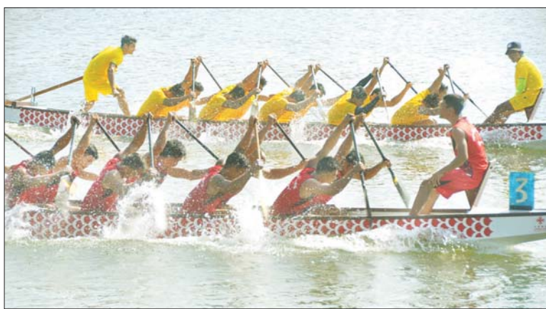
ရန်ကုန်မြို့ အင်းလျားကန်တွင် အပြည်ပြည်ဆိုင်ရာ လှေလှော်ကျင့်နေစဉ်။

ဗီယက်နမ်နိုင်ငံက အိမ်ရှင်အဖြစ် လက်ခံကျင်းပမည့် (၃၁)ကြိမ်မြောက် အရှေ့တောင်အာရှ အားကစားပြိုင်ပွဲတွင် ဝင်ရောက်ယှဉ်ပြိုင်ရန် မြန်မာနိုင်ငံ လှေလှော်အဖွဲ့ချုပ်မှ လှေလှော်အားကစား သမားများသည် ကနူး/ကယက် အားကစားနည်း၌ ရွှေတံဆိပ်ဆုရရှိရန် မျှော်မှန်းထားကြောင်း သိရသည်။