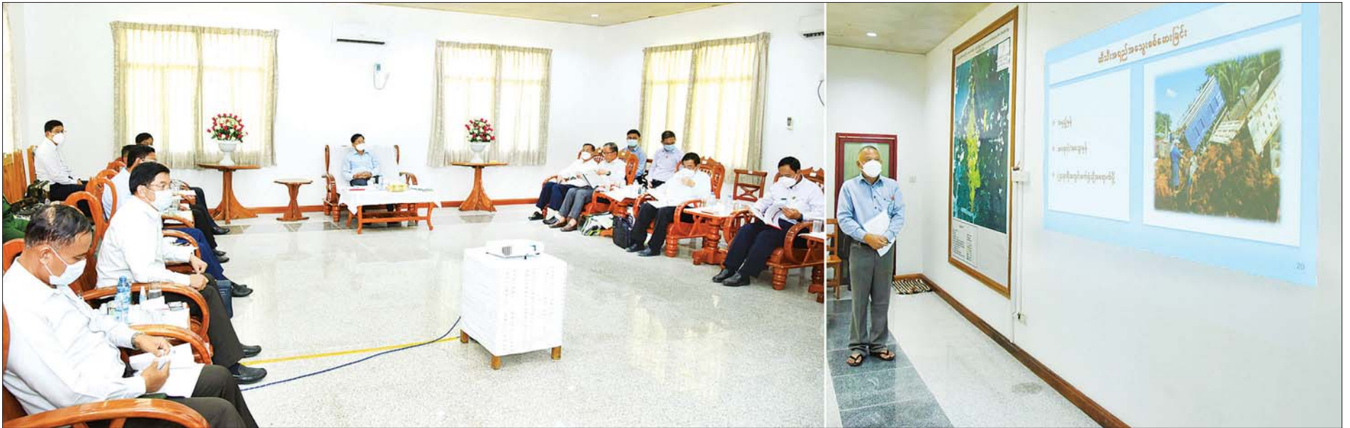
နိုင်ငံတော်စီမံအုပ်ချုပ်ရေးကောင်စီဥက္ကဋ္ဌ၊ နိုင်ငံတော်ဝန်ကြီးချုပ် ဗိုလ်ချုပ်မှူးကြီး မင်းအောင်လှိုင်အား တောင်ဒဂုံဆီအုန်းစိုက်ပျိုးရေးစီမံကိန်းနှင့်ပတ်သက်၍ တောင်ဒဂုံဆီအုန်းစိုက်ပျိုးရေးကုမ္ပဏီမှ တာဝန်ရှိသူ တစ်ဦးက ရှင်းလင်းတင်ပြစဉ်။