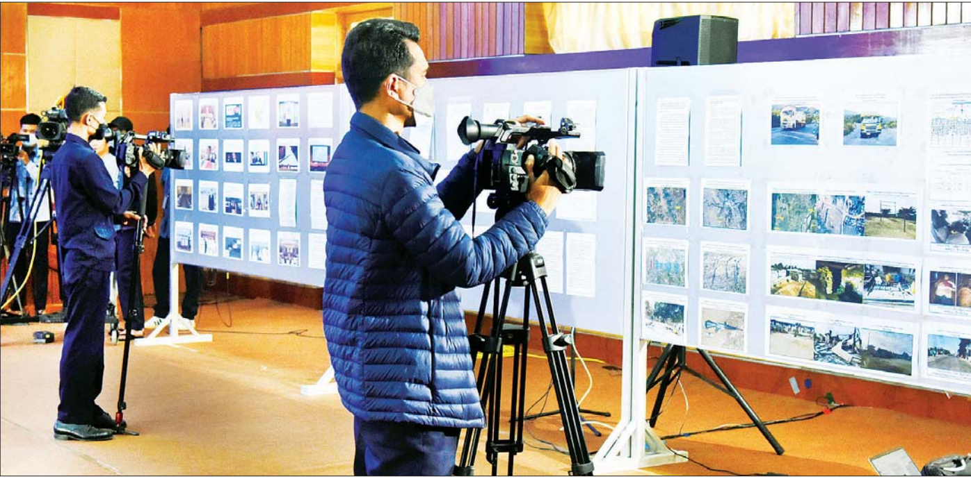
သတင်းစာရှင်းလင်းပွဲသို့ လာရောက်ကြသည့် သတင်းမီဒီယာများက ခင်းကျင်းပြသထားသည့်များကို မှတ်တမ်းရယူစဉ်။

ကာကွယ်၊ ထိန်းချုပ်၊ ကုသရေးလုပ်ငန်းစဉ်များကို စဉ်ဆက်မပြတ် ဆောင်ရွက်နေမှု၊ နိုင်ငံ၏အနာဂတ် လူသားအရင်းအမြစ် ဖြစ်ထွန်းနေသောနေ့နစ်နာစေမှု မရှိစေရန်အတွက် နိုင်ငံတော်စီမံအုပ်ချုပ်ရေး ကောင်စီအနေဖြင့် ကိုဗစ်-၁၉ ရောဂါကို အတိုင်း အတာတစ်ခုအထိ ထိန်းထားနိုင်သည့်အခြေအနေ တွင် NUG၊ CRPH၊ PDF အမည်ခံ အကြမ်းဖက်အဖွဲ့ များ၏နေ့စဉ်ယှက်မှုများ၊ CDM ပြုလုပ်သွားသည့် ဝန်ထမ်းများစသည့် အခက်အခဲများကြားမှ ပညာရေး မြှင့်တင်ရေးလုပ်ငန်းများကို အလေးထားဆောင်ရွက် နေသည့် အခြေအနေများကို ကျယ်ကျယ်ပြန့်ပြန့် ရှင်းလင်းပြောကြားသည်။ အကြမ်းဖက်မှုဖြစ်စဉ်များ ဆက်လက်၍ NUG၊ PDF အမည်ခံ အကြမ်းဖက် အဖွဲ့များလုပ်ဆောင်ခဲ့သည့် အကြမ်းဖက်မှုဖြစ်စဉ် များ၊ စစ်ရေးနှင့်သက်ဆိုင်သည့် ပစ်မှတ်များမဟုတ် သည့် လူနေအဆောက်အဦများ၊ အစိုးရအဆောက် အဦများ၊ ပညာရေးဆိုင်ရာအဆောက်အဦများနှင့် ဘာသာရေးဆိုင်ရာအဆောက်အဦများကို အကာ အကွယ်ရယူပြီး အပြစ်မဲ့ဒေသများကို လူသားဒိုင်း အဖြစ်အသုံးပြု၍ လုံခြုံရေးတပ်ဖွဲ့ဝင်များကို တိုက်ခိုက် နေမှု၊ ဂျီနီဗာကွန်ဗန်းရှင်းများနှင့် အပြည်ပြည်ဆိုင်ရာ ဥပဒေတို့အရ စစ်ရာဇဝတ်မှု (War Crime) ကျူးလွန် နေမှု၊ ပြည်သူလူထုအပေါ် ခြိမ်းခြောက်၊ သတ်ဖြတ်၊ လုယက်မှုများ၊ ဖမ်းဆီးရမိတရားခံ NLD ပါတီဝင် ဖြိုးဇေယျာသော်၏ ထွက်ဆိုချက်များအရ အကြမ်း ဖက်လုပ်ရပ်များ လုပ်ဆောင်ခဲ့သည့် အခြေအနေ၊