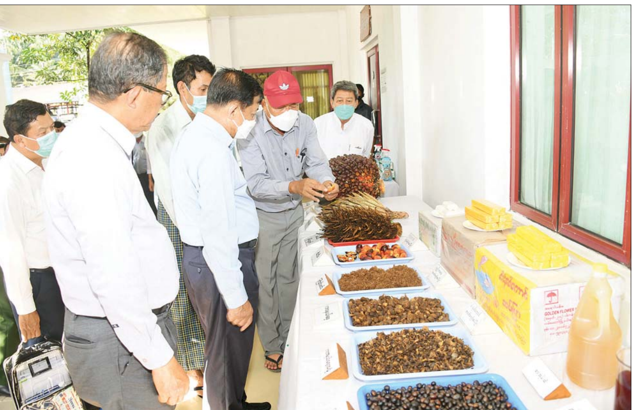
နိုင်ငံတော်စီမံအုပ်ချုပ်ရေးကောင်စီဥက္ကဋ္ဌ၊ နိုင်ငံတော်ဝန်ကြီးချုပ် ဗိုလ်ချုပ်မှူးကြီး မင်းအောင်လှိုင် တောင်ဒဂုံဆီအုန်းစိုက်ပျိုးရေးစီမံကိန်းမှ ထွက်ရှိသည့် ဆီသီးခိုင်များနှင့် ဆီသီးခိုင်မှထုတ်လုပ်သည့် ဆီနှင့် ဆပ်ပြာများကို ကြည့်ရှုစဉ်။

ယင်းနောက် တောင်ဒဂုံဆီအုန်းစိုက်ပျိုးရေးကုမ္ပဏီ အထွေထွေမန်နေဂျာ ဦးခိုင်ထူး၊ ယုဇနဆီအုန်းစိုက်ပျိုးရေးကုမ္ပဏီမှ ဦးအန်းဘန်တို့က တောင်ဒဂုံဆီအုန်း စိုက်ပျိုးရေးစီမံကိန်းနှင့်ပတ်သက်၍ စီမံကိန်းစတင်ဆောင်ရွက်ခဲ့မှုနှင့် ဆက်လက်အကောင်အထည်ဖော်ဆောင်ရွက်