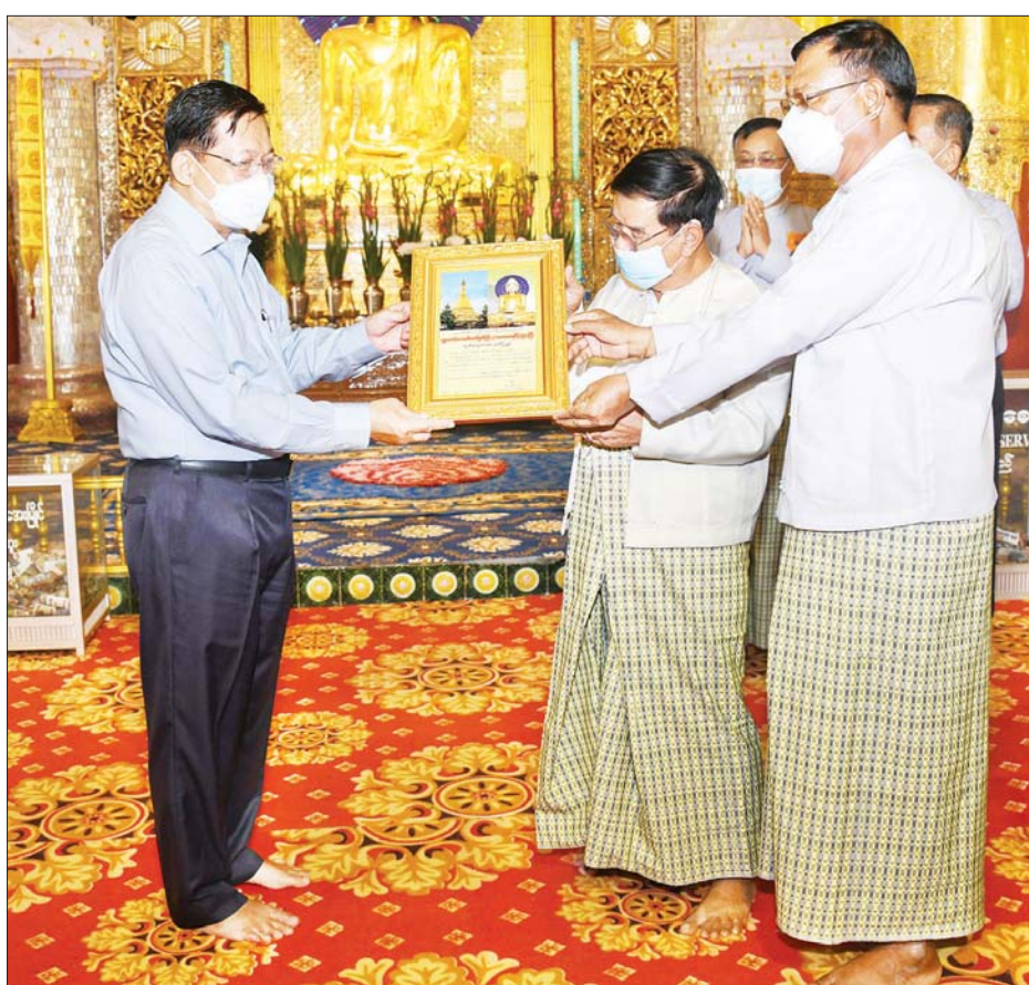
နိုင်ငံတော်စီမံအုပ်ချုပ်ရေးကောင်စီဥက္ကဋ္ဌ၊ နိုင်ငံတော်ဝန်ကြီးချုပ် ဗိုလ်ချုပ်မှူးကြီး မင်းအောင်လှိုင် အား လောကမာရဇိန်ရုပ်ပွားတော်မြတ်ကြီး၏ ဂေါပကအဖွဲ့ဝင်များက ဂုဏ်ပြုမှတ်တမ်းလွှာ ပြန်လည်ပေးအပ်စဉ်။

ထို့နောက် နိုင်ငံတော်စီမံအုပ်ချုပ်ရေးကောင်စီဥက္ကဋ္ဌ၊ နိုင်ငံတော်ဝန်ကြီးချုပ်သည် စေတီတော်ကြီးပရိဝုဏ်အတွင်းရှိ မဟာဝိဇယခေမသီတလ နိဗ္ဗူတဃောသ မဟာခေါင်းလောင်းတော်ကြီးကို ငါးချက်ထိုး၍ ပူဇော်ခဲ့ကြောင်း သတင်းရရှိသည်။ သတင်းစဉ်