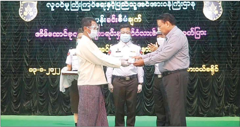
စာရင်း ၄၆၀၅ ခုနှင့် နိုင်ငံသား စိစစ်ရေးကတ် ၈၆၉၉ ကတ် ဆောင်ရွက်ပြီး ဖြစ်ကြောင်း၊ မြို့နယ်အလိုက် သတ်မှတ်ကာလ အတွင်း ဆောင်ရွက်ရမည့် လျာထားချက်ပြည့်မီ ပြီးစီးရေး အတွက် ဝိုင်းဝန်းကြိုးပမ်း

တွင် မရှိမဖြစ်အရေးကြီးသည့် ကတ်ပြားဖြစ်သည်နှင့်အညီ နိုင်ငံ သားအားလုံးက မဖြစ်မနေ ဆောင်ရွက်ကိုင်ဆောင်ထားကြ ရန်လိုကြောင်း၊ ပြည်သူများ ကုန်ကျစရိတ် သက်သာစေ ရေးအတွက် နိုင်ငံတော်မှ ပံ့ပိုး ကူညီ ဆောင်ရွက်ပေးလျက်ရှိရာ ကတ်ပြားမရှိသေးသူ ပြည်သူများ အနေဖြင့် သက်ဆိုင်ရာ ရပ်ကွက် နှင့် ကျေးရွာအုပ်ချုပ်ရေးမှူးများ၊ ရပ်မိရပ်ဖများထံ အသိပေး အကြောင်းကြားကာ ဆက်သွယ် ဆောင်ရွက်ကြရန်လိုကြောင်း။ တနင်္သာရီ တိုင်းဒေသကြီး အတွင်း ပန်းခင်းစီမံချက်ဖြင့် သက်ဆိုင်ရာ မြို့နယ်အလိုက် ကွင်းဆင်းဆောင်ရွက်လျက်ရှိရာ ယခုအထိ အိမ်ထောင်စုလူဦးရေ