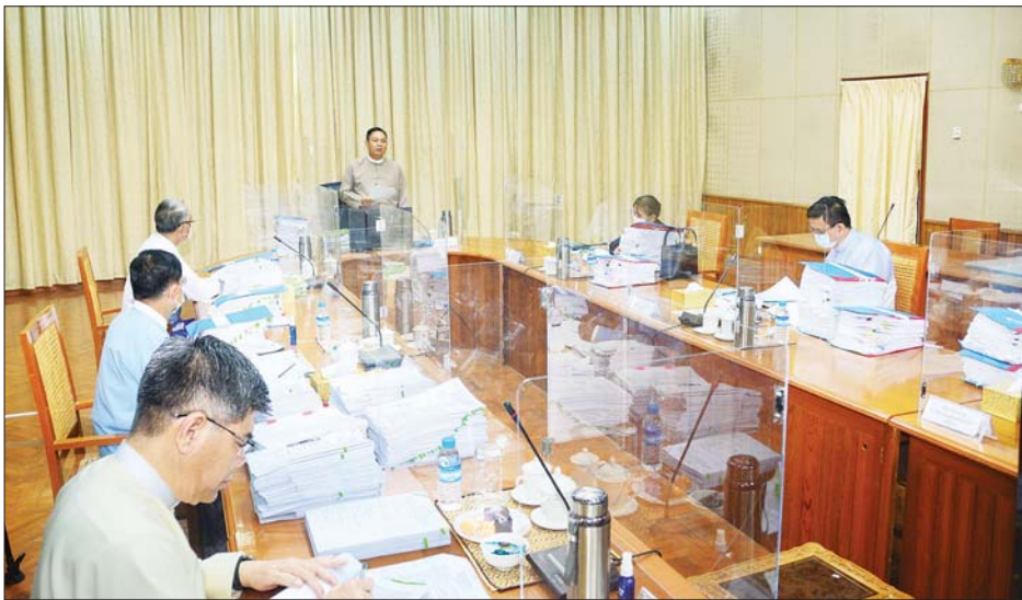
ဒေါ်လာ ၂၄၁ ဒဿမ ၇၉ သန်းနှင့် ငွေကျပ် ၈၀၆၀၆၆ ဒဿမ ၅၉၅ သန်းရှိပြီး ပြည်တွင်းလုပ်သားများအတွက် အလုပ်အကိုင် အခွင့်အလမ်းပေါင်း ၂၆၄၆ နေရာကို ဖန်တီးပေးနိုင်မည်ဖြစ်သည်။

အစည်းအဝေး၌ ဆောင်ရွက်ဆဲ ရင်းနှီးမြှုပ်နှံမှု လုပ်ငန်း (၅) ခု၏ မတည်ငွေရင်း တိုးမြှင့်ခြင်း အပါ အဝင် မွေးမြူရေးနှင့် ရေလုပ်ငန်းကဏ္ဍ၊ ကုန်ထုတ် လုပ်မှုကဏ္ဍ၊ သတ္တုကဏ္ဍနှင့် ဝန်ဆောင်မှုကဏ္ဍများ၌ လုပ်ငန်းသစ် ၁၀ ခုကို ခွင့်ပြုခဲ့သည်။ အဆိုပါ လုပ်ငန်း များ၏ ရင်းနှီးမြှုပ်နှံမှုပမာဏသည် အမေရိကန်