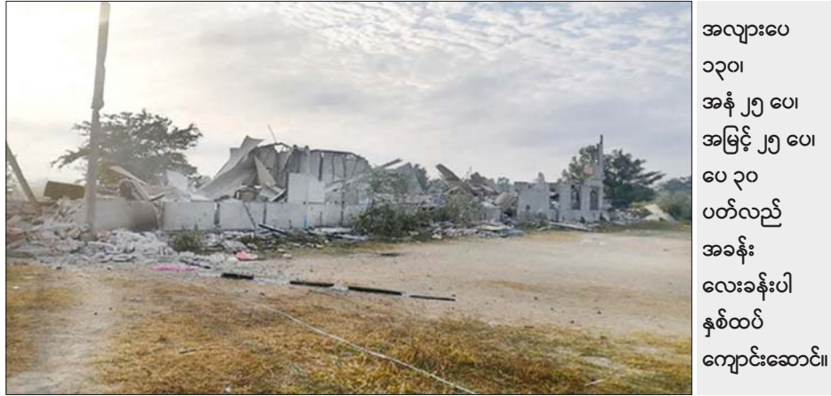
အလျားပေ ၁၃၀၊ အနံ ၂၅ ပေ၊ အမြင့် ၂၅ ပေ၊ ပေ ၃၀ ပတ်လည် အခန်းလေးခန်းပါ နှစ်ထပ်ကျောင်းဆောင်။