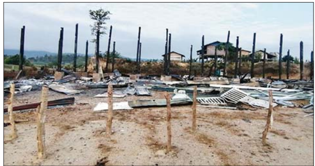
အလျားပေ ၈၀၊ အနံ ၁၈ ပေ၊ အမြင့် ၁၅ ပေ၊ ၁၈ ပေပတ်လည် အခန်းငါးခန်းပါ တစ်ထပ်ပျဉ်ကျောင်းဆောင် မီးလောင်ကျွမ်းမှု မှတ်တမ်းဓာတ်ပုံ။

အထောက်အကူပြုသည့် ပညာရည်မြှင့်တင်မှုကို ပိတ်ပင်ဖျက်ဆီးမှုဖြစ်သဖြင့် ဂျီနီဗာကွန်ဗန်းရှင်းများနှင့် အပြည်ပြည်ဆိုင်ရာ ဥပဒေတို့အရ စစ်ရာဇဝတ်မှု (War Crime) ကျူးလွန်ခြင်းဖြစ်ပြီး အဆိုပါ လုပ်ရပ်များအပေါ် ဒေသခံပြည်သူများအနေဖြင့် ရွံရှာစက်ဆုပ်မုန်းတီးလျက်ရှိကြောင်း သိရှိရသည်။ အထက်ပါ အကြမ်းဖက်လုပ်ရပ်များကို ကျူးလွန်ခဲ့သူများအား လုံခြုံရေးတပ်ဖွဲ့ဝင်များက ရှာဖွေဖော်ထုတ်ချေမှုန်း၊ သုတ်သင်သွားမည်ဖြစ်ကြောင်းနှင့် အကြမ်းဖက်အဖွဲ့များ၏ ဝင်ထွက်သွားလာမှု သတင်းများရရှိပါက သက်ဆိုင်ရာသို့ လျှို့ဝှက်စွာသတင်းပေး၍ နယ်မြေ တည်ငြိမ်အေးချမ်းရေးအတွက် ပူးပေါင်းပါဝင်ကြရန် သက်ဆိုင်ရာက သတင်းထုတ်ပြန်ထားကြောင်း သိရှိရသည်။ သတင်းစဉ်