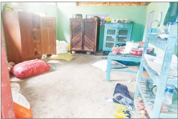
အကြမ်းဖက်သူများ ရိက္ခာသိုလှောင်ထားသည့် အခန်းနှင့် ချက်ပြုတ်ရာတွင် အသုံးပြုသည့် ပစ္စည်းများကို တွေ့ရစဉ်။