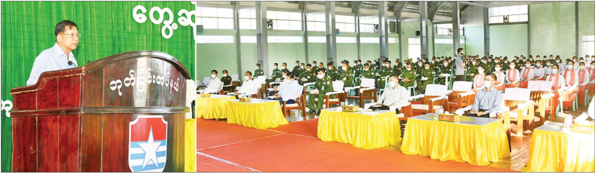
နိုင်ငံတော်စီမံအုပ်ချုပ်ရေးကောင်စီဥက္ကဋ္ဌ၊ တပ်မတော်ကာကွယ်ရေးဦးစီးချုပ် ဗိုလ်ချုပ်မှူးကြီး မင်းအောင်လှိုင် ဘုတ်ပြင်းတပ်နယ်မှ အရာရှိ၊ စစ်သည် မိသားစုဝင်များအား တွေ့ဆုံအမှာစကား ပြောကြားစဉ်။