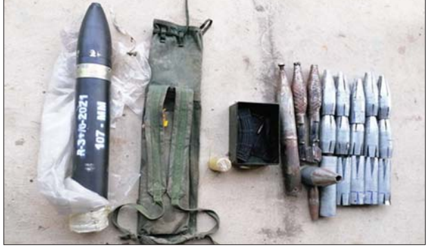
သိမ်းဆည်းရမိသည့် ၁၀၇ မမ ခွဲသီးနှင့် လက်လုပ်စီနီပြောင်းဗုံးသီးများ။