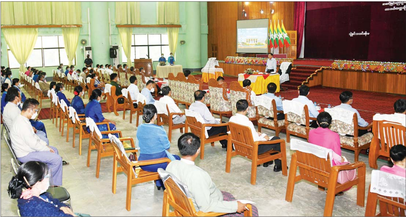
နိုင်ငံတော်စီမံအုပ်ချုပ်ရေးကောင်စီဥက္ကဋ္ဌ၊ နိုင်ငံတော်ဝန်ကြီးချုပ် ဗိုလ်ချုပ်မှူးကြီး မင်းအောင်လှိုင် ထားဝယ်တက္ကသိုလ်ဘွဲ့နှင့်သဘာဝခန်းမတွင် ဆရာ၊ ဆရာမများအား တွေ့ဆုံအမှာစကား ပြောကြားစဉ်။

ထို့နောက် ပညာရေးဝန်ကြီးဌာန ပြည်ထောင်စုဝန်ကြီး ဒေါက်တာညွန့်ဖေက ထားဝယ်တက္ကသိုလ်မှ ပညာသင်နှစ်အလိုက် ဘွဲ့ရပညာတတ်များ မွေးထုတ်ပေးနိုင်ခဲ့မှုအခြေအနေ၊ တက္ကသိုလ်တွင် အမှန်တကယ် လိုအပ်သည့် သင်ကြားမှုသင်ယူမှု အထောက်အကူပြုပစ္စည်းများနှင့် တက္ကသိုလ်ဥပမီရပ်ကောင်းမွန်စေရေး ဆောင်ရွက်နိုင်မည့် အခြေအနေများနှင့် ပတ်သက်၍ လိုအပ်ချက်များကို တင်ပြသည်။