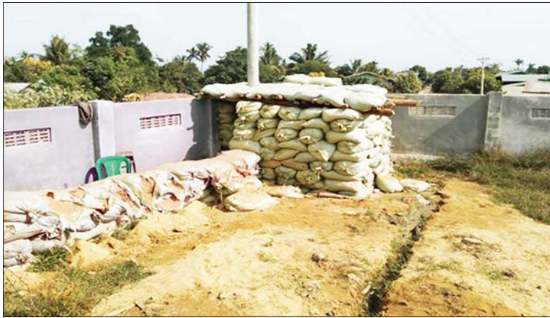
ကျောင်းဝင်းအတွင်း သိမ်းဆည်းရမိသည့် သဲအိတ်ဘန်ကာကို တွေ့ရစဉ်။