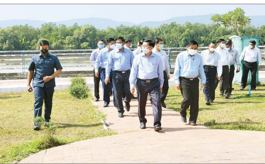
နိုင်ငံတော်စီမံအုပ်ချုပ်ရေးကောင်စီဥက္ကဋ္ဌ၊ နိုင်ငံတော်ဝန်ကြီးချုပ် ဗိုလ်ချုပ်မှူးကြီး မင်းအောင်လှိုင် ထားဝယ်မြို့ တလိုင်ထိန်ရပ်ကွက်ရှိ ဆိပ်ကမ်းသာပန်းခြံအတွင်း ကြည့်ရှုစစ်ဆေးစဉ်။

စာမျက်နှာ ၅ မှ သန့်ရှင်းသာယာလှပရေးနှင့် အပန်းဖြေရိပ်သာ အပါအဝင် နေချင့်စဖွယ် ပတ်ဝန်းကျင်ဖြစ်အောင် ဖန်တီးပေးထားရန် လိုအပ်မည်ဖြစ်ကြောင်း၊ တက္ကသိုလ်တွင် လိုအပ်သည့် ကျောင်းသား၊ ကျောင်းသူ အိပ်ဆောင်များကို အမြန်ဆုံး ဖြည့်ဆည်းဆောင်ရွက်ပေးရန် လိုကြောင်း၊ လောင်းလုံး၊ သရက်ချောင်းနှင့် အခြား အလှမ်းကွာဝေးသည့်ဒေသများမှ လာရောက်ပညာသင်ကြားသူများအတွက် နေထိုင်စားသောက်မှုအဆင်ပြေအောင် လုပ်ဆောင်ပေးရမည်ဖြစ်ကြောင်း၊ သဘာဝအေးအန္တရာယ်နှင့် အခြားအရေးပေါ် အခြေအနေများအတွက်လည်း ကြိုတင်မျှော်မှန်း ပြင်ဆင်ဆောင်ရွက်ပေးထားရန် လိုအပ်မည်ဖြစ်ကြောင်းနှင့် လိုအပ်သည်များကို နိုင်ငံတော်မှ ဖြည့်ဆည်းဆောင်ရွက်ပေးမည်ဖြစ်ကြောင်း။ နိုင်ငံတကာနှင့်ရင်ပေါင်တန်းနိုင်ရေး ထို့ပြင် ကျောင်းသား၊ ကျောင်းသူများ၏ ရုပ်ပိုင်း၊ စိတ်ပိုင်းဆိုင်ရာ ကျန်းမာကြံ့ခိုင်မှုရှိအောင် လုပ်ဆောင်ပေးရမည်ဖြစ်ကြောင်း၊ မိမိတို့နိုင်ငံအနေဖြင့် ပါတီစုံဒီမိုကရေစီလမ်းကြောင်းပေါ်တွင် လျှောက်လှမ်းလျက်ရှိပြီး ဈေးကွက်စီးပွားရေးစနစ်ကို ဖော်ဆောင်နေသည့်အတွက် ဥပဒေနှင့် စီးပွားရေးအတတ်ပညာကို နိုင်ငံနှင့်အဝန်း သိရှိရန် လိုအပ်မည် ဖြစ်ကြောင်း၊ ထို့ကြောင့် တက္ကသိုလ်တိုင်းတွင် ယခင်