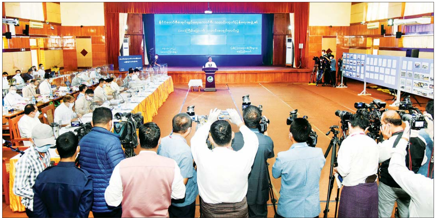
နိုင်ငံတော်စီမံအုပ်ချုပ်ရေးကောင်စီ၊ သတင်းထုတ်ပြန်ရေးအဖွဲ့၏ (၁၁) ကြိမ်မြောက် သတင်းစာရှင်းလင်းပွဲ ကျင်းပစဉ်။

သတင်းစာရှင်းလင်းပွဲမတင်မီ တက်ရောက်လာကြသူများကို ကိုဗစ်-၁၉ ရောဂါ ကြိုတင်ကာကွယ်ရေးအတွက် တာဝန်ရှိသူများက လိုအပ်သည့် ကျန်းမာရေးဆိုင်ရာများ ဆောင်ရွက်ပေးပြီး စာမျက်နှာ ၁၆ ကော်လံ ၁ ။