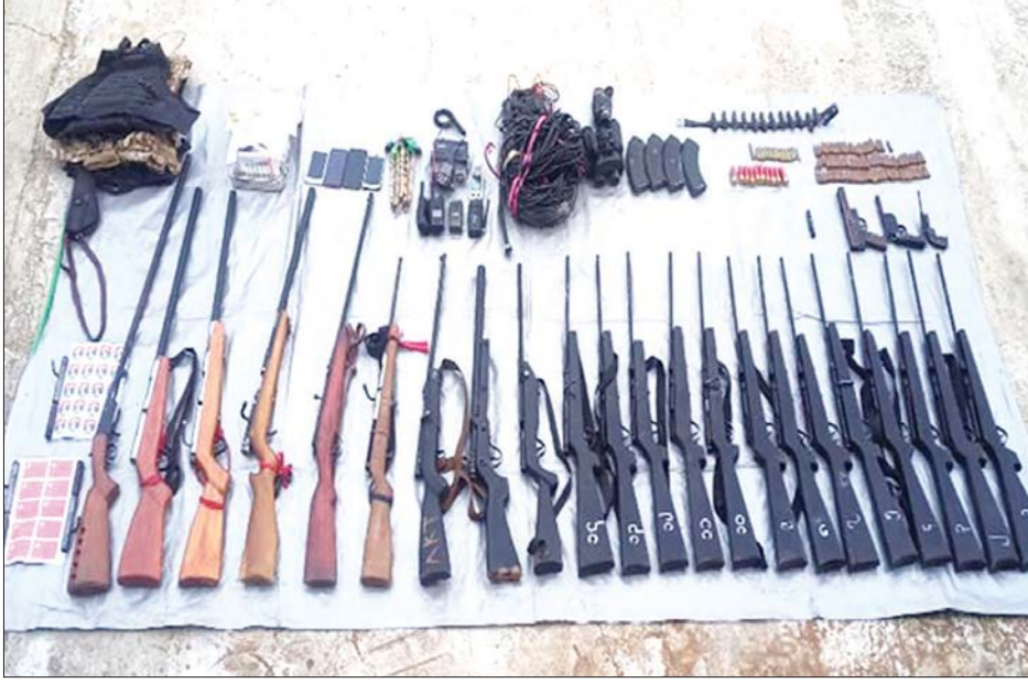
အကြမ်းဖက်သူများထံမှ သိမ်းဆည်းရမိသည့် လက်နက်နှင့် ဆက်စပ်ပစ္စည်းများ။

ပါက နီးစပ်ရာလုံခြုံရေးတပ်ဖွဲ့ဝင် ကြပ်ရန် သက်ဆိုင်ရာက ကြောင်း သိရသည်။ များထံသို့ လျှို့ဝှက်သတင်းပေးပို့ တိုက်တွန်းသတင်းထုတ်ပြန်ထား သတင်းစဉ်