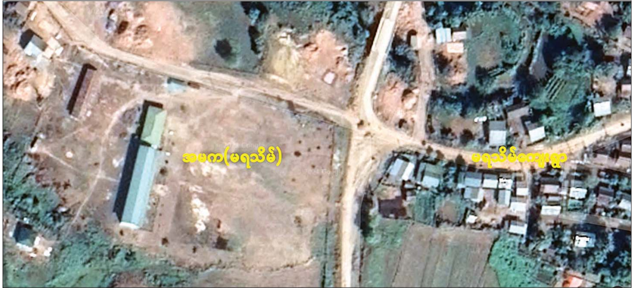
ထီးချိုင့်မြို့နယ် မရသိမ်ကျေးရွာရှိ စာသင်ကျောင်းအား တွေ့မြင်ရပုံ။

လုပ်ရပ်များ လုပ်ဆောင်နေသဖြင့် လုံခြုံရေးတပ်ဖွဲ့ဝင်များက သွားရောက် ချေမှုန်းတိုက်ခိုက်ခဲ့ရာ ၁၀၇ မမ ရှော့တိုက်ခွဲသီး အပါအဝင် လက်နက်ခဲယမ်း၊ ဗုံးသီးများ နှင့် အကြမ်းဖက်မှုများ ဆောင်ရွက်ရာတွင် အသုံးပြုသည့် ဆက်စပ်ပစ္စည်းများကို သိမ်းဆည်းရမိခဲ့သည်။ အဆိုပါ လုံခြုံရေးတပ်ဖွဲ့ဝင်များ၏ တိုက်ခိုက်မှုကြောင့် ဖရိုဖရဲ ဆုတ်ခွာသွားသော အကြမ်းဖက်အဖွဲ့များသည် လုံခြုံရေးတပ်ဖွဲ့ဝင်များ လိုအပ်သည့် နယ်မြေလုံခြုံရေးလုပ်ငန်းများ ဆက်လက်