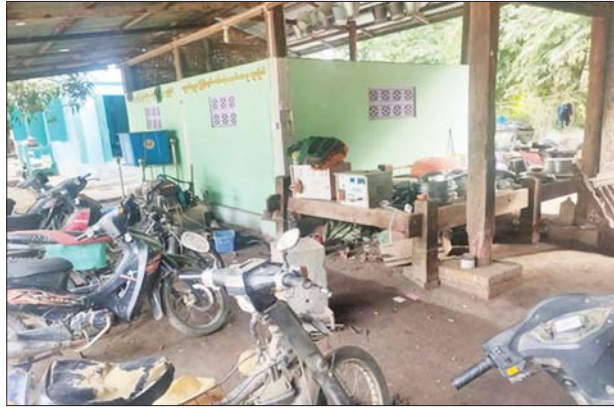
ဘုန်းကြီးကျောင်းအတွင်း အကြမ်းဖက်သူများနေထိုင်သည့် နေရာကို တွေ့ရစဉ်။