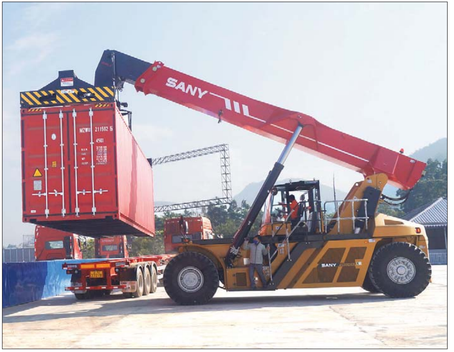
၂၀၂၁ခုနှစ် နိုဝင်ဘာလ ၂၆ ရက်က မူဆယ် (ကျင်စန်းကျောက်တိုင်)မှ တရုတ်နိုင်ငံဘက်သို့ ပို့ဆောင်မည့် ကွန်တိန်နာယာဉ်များပေါ်သို့ ကုန်ပစ္စည်းများ တင်ဆောင်နေမှုကို တွေ့ရစဉ်။