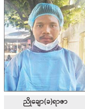
ညိုချော(ခ)ရာဇာ