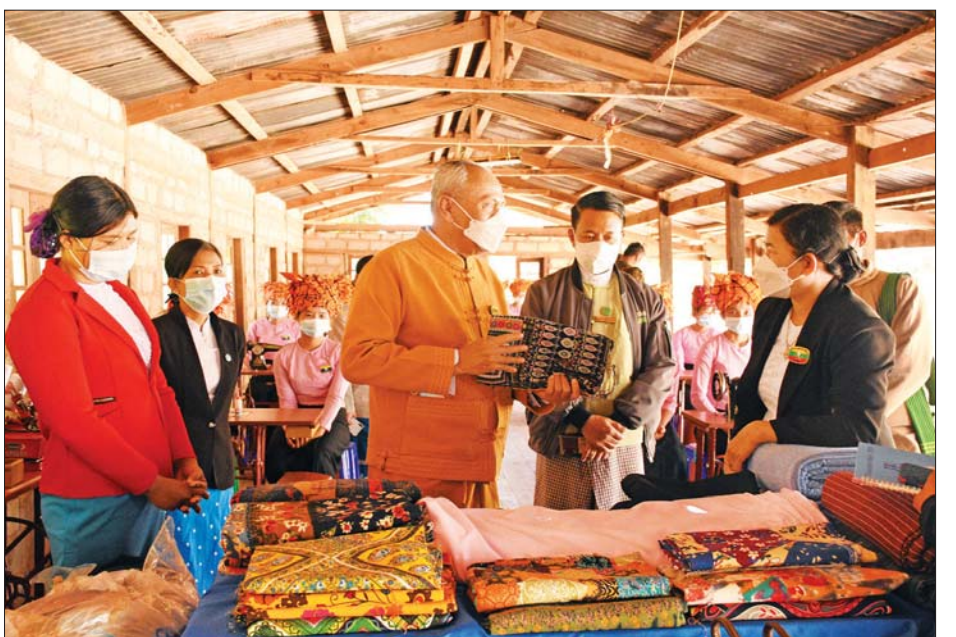
ပညာသင်တန်း ဖွင့်ပွဲအခမ်းပညာသင်တန်း ဖွင့်ပွဲအခမ်း အနားကို ဇန်နဝါရီ ၆ ရက် နံနက် ၁၀ နာရီတွင် ကျင်းပရာ ရှမ်းပြည်နယ်တိုင်းရင်းသားရေးရာ ဝန်ကြီးဦးအောင်ကြည်ဝင်းက ကြိုဆိုကြားပြီး ရှမ်းပြည်နယ်အစိုးရအဖွဲ့က ထောက်ပံ့သော အုပ်ချုပ်စက်နှင့် ဆက်စပ်ပစ္စည်းများ၊ သင်ထောက်ကူ ပစ္စည်းများ ပေးအပ်ခြင်းနှင့် တိုင်းရင်းသား အခွင့်အရေးများ ကာကွယ် စောင့်ရှောက်ရေး ဦးစီးဌာန ဒုတိယ ညွှန်ကြားရေးမှူးချုပ်က သင်တန်း ဖွင့်လှစ်ခြင်း အကြောင်းရင်းနှင့် ရည်ရွယ်ချက်ကို ရှင်းလင်းပြောကြားသည်။ အဆိုပါသင်တန်းကို တိုင်းရင်းသားလူမျိုးများ၏ ဒေသအတွင်း ရပ်ရွာအခြေပြု အသက်မွေးဝမ်းကျောင်းပညာများ တိုးတက်ဖြစ်ထွန်းလာစေရေးနှင့် အလုပ်အကိုင် အခွင့်အလမ်းပိုမိုရရှိပြီး လူမှုစီးပွားဘဝ မြှင့်တင်တိုးတက်ရေး ရည်ရွယ်ချက်များဖြင့် ဖေဖော်ဝါရီ ၅ ရက်အထိ တစ်လကြာ ဖွင့်လှစ်သင်ကြားပေးမည် ဖြစ်သည်။

အောင်ပန်း ဇန်နဝါရီ ၇ အဆိုပါ အခြေခံစက်ချုပ် ပညာသင်တန်း ဖွင့်ပွဲအခမ်းပညာသင်တန်း ဖွင့်ပွဲအခမ်း အနားကို ဇန်နဝါရီ ၆ ရက် နံနက် ၁၀ နာရီတွင် ကျင်းပရာ ရှမ်းပြည်နယ်တိုင်းရင်းသားရေးရာ ဝန်ကြီးဦးအောင်ကြည်ဝင်းက ကြိုဆိုကြားပြီး ရှမ်းပြည်နယ်အစိုးရအဖွဲ့က ထောက်ပံ့သော အုပ်ချုပ်စက်နှင့် ဆက်စပ်ပစ္စည်းများ၊ သင်ထောက်ကူ ပစ္စည်းများ ပေးအပ်ခြင်းနှင့် တိုင်းရင်းသား အခွင့်အရေးများ ကာကွယ် စောင့်ရှောက်ရေး ဦးစီးဌာန ဒုတိယ ညွှန်ကြားရေးမှူးချုပ်က သင်တန်း ဖွင့်လှစ်ခြင်း အကြောင်းရင်းနှင့် ရည်ရွယ်ချက်ကို ရှင်းလင်းပြောကြားသည်။ အဆိုပါသင်တန်းကို တိုင်းရင်းသားလူမျိုးများ၏ ဒေသအတွင်း ရပ်ရွာအခြေပြု အသက်မွေးဝမ်းကျောင်းပညာများ တိုးတက်ဖြစ်ထွန်းလာစေရေးနှင့် အလုပ်အကိုင် အခွင့်အလမ်းပိုမိုရရှိပြီး လူမှုစီးပွားဘဝ မြှင့်တင်တိုးတက်ရေး ရည်ရွယ်ချက်များဖြင့် ဖေဖော်ဝါရီ ၅ ရက်အထိ တစ်လကြာ ဖွင့်လှစ်သင်ကြားပေးမည် ဖြစ်သည်။ သွန်း