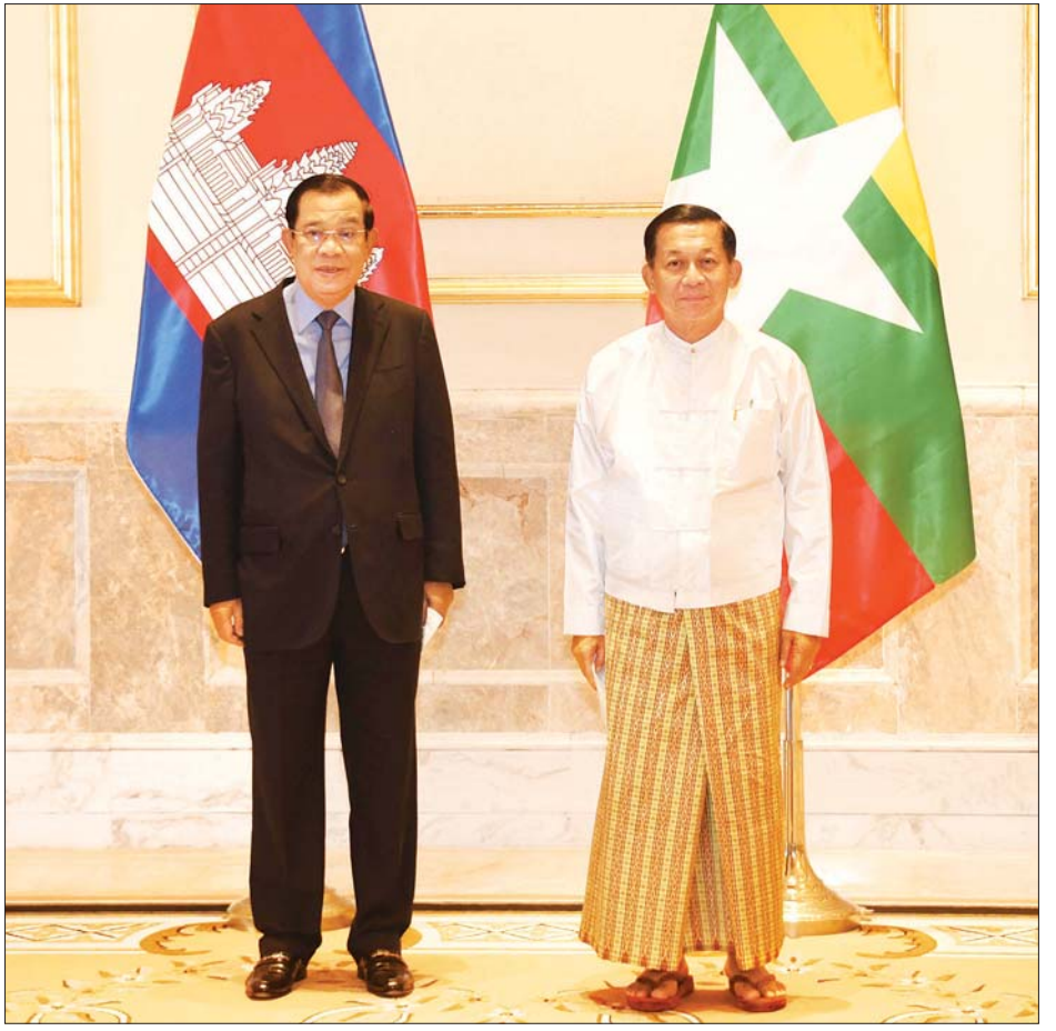
နိုင်ငံတော်စီမံအုပ်ချုပ်ရေးကောင်စီဥက္ကဋ္ဌ၊ နိုင်ငံတော်ဝန်ကြီးချုပ် ဗိုလ်ချုပ်မှူးကြီး မင်းအောင်လှိုင် နှင့် ကမ္ဘောဒီးယားနိုင်ငံဝန်ကြီးချုပ် Samdech Akka Moha Sena Padei Techo HUN SEN တို့ မှတ်တမ်း တင် ဓာတ်ပုံရိုက်စဉ်။

တက်ရောက် တွေ့ဆုံပွဲသို့ နိုင်ငံတော်စီမံ အုပ်ချုပ်ရေးကောင်စီဥက္ကဋ္ဌ၊ နိုင်ငံ တော်ဝန်ကြီးချုပ်နှင့်အတူ ကောင်စီ တွဲဖက်အတွင်းရေးမှူး ဒုတိယ ဗိုလ်ချုပ်ကြီး ရဲဝင်းဦး၊ ပြည်ထောင်စု ဝန်ကြီးများဖြစ်ကြသည့် ဦးဝဏ္ဏ မောင်လွင်နှင့် ဦးကိုကိုလှိုင်၊ ညွှန်ကြား ကွပ်ကဲရေးမှူး (ကြည်း၊ ရေ၊ လေ) ဗိုလ်ချုပ်ကြီး မောင်မောင်အေးတို့ တက်ရောက်ကြပြီး ကမ္ဘောဒီးယား ဝန်ကြီးချုပ်နှင့်အတူ ဒုတိယ ဝန်ကြီးချုပ်၊ နိုင်ငံခြားရေးနှင့်