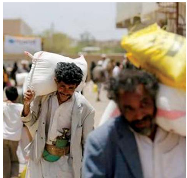
ထောက်ပံ့ရေးပစ္စည်းများ သယ်ဆောင်လာကြသူများကို တွေ့ရစဉ်။

၂၀၂၁ ခုနှစ် လူသားချင်း အထောက်အပံ့မှာလည်း လူပေါင်း စာနာထောက်ထားမှု ဆိုင်ရာ ကိစ္စများအတွက် လိုအပ်သည့် ရန်ပုံငွေထဲမှ ၅၈ ရာခိုင်နှုန်းကို သာလက်ခံရရှိခဲ့ပြီး အမေရိကန် ဒေါ်လာ ၁ ဒသမ ၆ ဘီလီယံ လိုအပ်နေဆဲဖြစ်သည်။ ရလဒ် အနေဖြင့် အကူအညီပေးရေး အေဂျင်စီများသည် ကူညီပေး နေမှုများကို လျှော့ချနေရသည်ဟု အိုစီအိတ်ချ်အေက ပြောသည်။ အရေးပေါ် အစားအသောက် ရှစ်သန်းစာအတွက် လျှော့ချနေရ သည်။ အလားတူ ကျန်းမာရေး၊ ရေရရှိမှုနှင့် အခြားသောအစီ အစဉ်များကိုလည်း လျှော့ချနေရ သည်ဟု သိရသည်။ ယီမင်နိုင်ငံတွင် အကူအညီ များရရှိရန် အလှူရှင်နိုင်ငံများက ကူညီမှုများ ဆက်လက်ပေးသွား ရန် ကုလသမဂ္ဂက အလှူရှင် နိုင်ငံများကို တိုက်တွန်းလျက် ရှိသည်။ ဆင်ယွာ