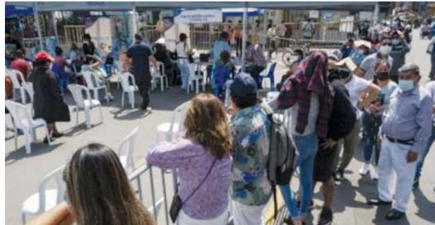
ပီရူးနိုင်ငံ လီမာမြို့တွင် ကိုဗစ်-၁၉ ဆေးစစ်မှုခံယူရန် စောင့်ဆိုင်း နေကြသူများကို တွေ့ရစဉ်။

လီမာ ဇန်နဝါရီ ၇ ပီရူးနိုင်ငံတွင် ကိုဗစ် -၁၉ ကြောင့် မိဘတစ်ဦး သို့မဟုတ် မူလအုပ်ထိန်းသူ ဆုံးရှုံးသွားသည့် ကလေးငယ်ပေါင်း ၁၀၀၀၀၀ နီးပါး ရှိသည်ဟု အစိုးရက ဇန်နဝါရီ ၆ ရက်တွင် သတင်းထုတ်ပြန်သည်။ ပီရူးနိုင်ငံမှာ ကမ္ဘာပေါ်တွင် ကိုဗစ် -၁၉ ကြောင့် သေဆုံးမှုနှုန်း အမြင့်ဆုံးထဲမှ တစ်နိုင်ငံဖြစ်သည်။ ကံဆိုး မိုးမှောင်ကျစွာပင် ပီရူးနိုင်ငံ၌ ကိုဗစ် - ၁၉ ကြောင့် မိဘတစ်ဦး သို့မဟုတ် အုပ်ထိန်းသူ ဆုံးရှုံးသွားရသည့် ကလေး ၉၈၀၀၀ နီးပါး ရှိသည်ဟု ပီရူး အမျိုးသမီးရေးရာဝန်ကြီး အနဟီဒူရန်က ပြောသည်။ ပီရူးအစိုးရသည် လတ် တလောတွင် မိသားစုပေါင်း ၁၈၀၀၀ ကျော်ကို နှစ်လလျှင် တစ်ကြိမ် အမေရိကန်ဒေါ်လာ ၅၀ ပင်စင်ငွေအဖြစ် ထောက်ပံ့ ပေးသည်။ ကလေးငယ်နှင့် ဆယ်ကျော် သက်အရွယ် ၈၃၀၀၀ အတွက်