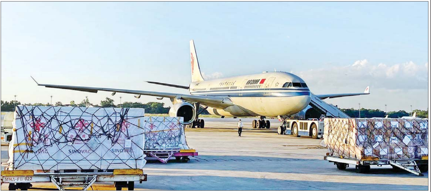
၂၀၂၁ ခုနှစ် နိုဝင်ဘာလ ၂၁ ရက်က တရုတ်ပြည်သူ့သမ္မတနိုင်ငံမှ ထပ်မံလှူဒါန်းသည့် Sinovac အမှတ်တံဆိပ် ကိုဗစ်-၁၉ ရောဂါကာကွယ်ဆေး သုံးသန်း doses အနက် တတိယအသုတ်တစ်သန်း doses ရန်ကုန်အပြည်ပြည်ဆိုင်ရာလေဆိပ်သို့ ထပ်မံရောက်ရှိစဉ်။

ဆောက်လုပ်ရေး ဝန်ကြီးဌာန ပြည်ထောင်စုဝန်ကြီး ဦးရွှေလေးသည် နိုဝင်ဘာ ၂၈ ရက်တွင် ရန်ကုန်တိုင်းဒေသကြီး ကျေးလက်လမ်းဖွံ့ဖြိုးရေး ဦးစီးဌာနမှ ဆောင်ရွက်သော တိုက်ကြီး မြို့နယ်အတွင်း ကျေးလက်ချင်းဆက်လမ်း ကွန်ကရစ်ခင်းပြီးစီးမှု၊ လှိုင်မြစ်-လှိုင်ကား ရေအားဖြည့်စီမံကိန်း ဆောင်ရွက်မှု၊ ရန်ကုန် - ပြည်လမ်းပိုင်း မော်ဘီမြို့အတွင်း မြေအောက်အနက် ၁၀ ပေတူး၍ ၅ ပေအချင်းရှိ ရေပိုက်လှိုင်း သွယ်တန်းထားမှု၊ ရန်ကုန်မြောက်ပိုင်း ခရိုင် လမ်းဦးစီးဌာနမှ အမှတ် (၄) လမ်းမကြီး ပြုပြင်ထိန်းသိမ်းမှု၊ ရန်ကုန်-နေပြည်တော်-မန္တလေးအမြန်လမ်းမကြီး (ရန်ကုန်-နေပြည်တော်) အပိုင်း