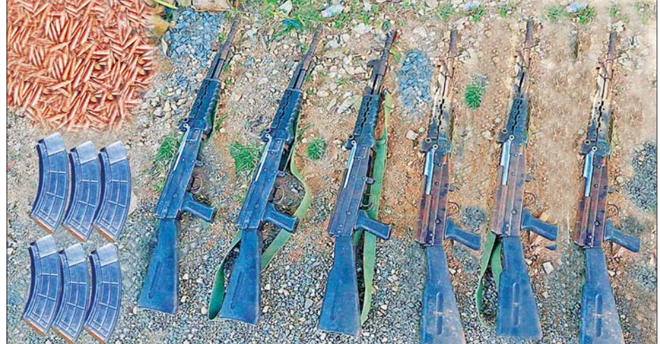
KNPP အဖွဲ့နှင့် PDF အမည်ခံ အကြမ်းဖက်အဖွဲ့များထံမှ သိမ်းဆည်းရမိသည့် လက်နက်၊ ခဲယမ်းနှင့် ဆက်စပ်ပစ္စည်းများကို တွေ့ရစဉ်။

ဒဏ်ရာရရှိခဲ့ပြီး အကြမ်းဖက်အဖွဲ့ စစ်ကြောင်းများ နယ်မြေလုံခြုံရေး များထံမှ အလောင်းနှင့်လက်နက်/ နှင့် နယ်မြေစိုးမိုးရေးစခန်းများ ခဲယမ်းအချို့အပါအဝင် ဆက်စပ် အား လာရောက်တိုက်ခိုက်ပါမူ ပစ္စည်းတို့အား သိမ်းဆည်းရရှိခဲ့ ထိရောက်ပြင်းထန်စွာ မိမိကိုယ် မိမိ ခုခံကာကွယ်ပိုင်ခွင့်အသုံးပြု သည်။ လျက် တုံ့ပြန်ရန် အခွင့်အရေး လျှင်မြန်စွာ နယ်စပ်ဒေသ တည်ငြိမ်ရေးနှင့် လုံခြုံရေး အတွက် လိုအပ်သော လုံခြုံရေး လုပ်ငန်းများကို နေ့ညမပြတ် ဆောင်ရွက်လျက်ရှိရာ အကြမ်း ဖက်အဖွဲ့များအနေဖြင့် လုံခြုံရေး တပ်ဖွဲ့ဝင်များ၏ အလစ်အငိုက် သတင်းစဉ်