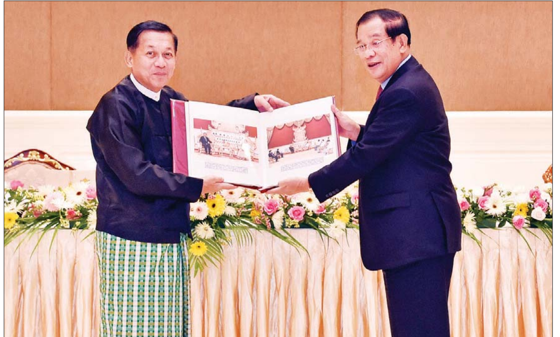
နိုင်ငံတော်စီမံအုပ်ချုပ်ရေးကောင်စီ ဥက္ကဋ္ဌ ၊ နိုင်ငံတော်ဝန်ကြီးချုပ် ဗိုလ်ချုပ်မှူးကြီး မင်းအောင်လှိုင် ကမ္ဘောဒီးယားနိုင်ငံ ဝန်ကြီးချုပ် Samdech Akka Moha Sena Padei Techo HUN SEN အား ခရီးစဉ်မှတ်တမ်းစာတိုက် အယ်လ်ဘမ်ကို ပေးအပ်စဉ်။

ရာပြည့်၊ ဦးဝင်းရှိန်၊ ဦးအောင်နိုင်ဦး၊ ဦးကိုကိုလှိုင်၊ ဦးကိုကို၊ ဒေါက်တာ သက်ခိုင်ဝင်း၊ ဒေါက်တာ သက်သက်ခိုင်၊ ဒေါက်တာ ဌေးအောင်၊ ညှိနှိုင်းကွပ်ကဲရေးမှူး (ကြည်း၊ ရေ၊ လေ) ဗိုလ်ချုပ်ကြီး မောင်မောင်အေး၊ ဒုတိယဝန်ကြီး ဦးကျော်မျိုးထွဋ်၊ ကမ္ဘောဒီးယားနိုင်ငံဆိုင်ရာ မြန်မာနိုင်ငံသံအမတ်ကြီး ဦးသစ်လင်းအုန်းနှင့် တာဝန်ရှိသူများ တက်ရောက်ကြပြီး ကမ္ဘောဒီးယားဝန်ကြီးချုပ်နှင့်အတူ ဒုတိယဝန်ကြီးချုပ် H. E. Mr. PRAK Sokhonn ၊ ဝါရင့်ဝန်ကြီး၊ စက်မှု၊ သိပ္ပံ၊ နည်းပညာနှင့် တီထွင်ဆန်းသစ်မှုဝန်ကြီး H.E. Mr. CHAM Prasidh ၊ ဝန်ကြီးချုပ်ရုံး ဝန်ကြီးနှင့် ကမ္ဘောဒီးယားနိုင်ငံ ဖွံ့ဖြိုးတိုးတက်ရေးကောင်စီ အထွေထွေအတွင်းရေးမှူး H.E. Mr. SOK Chenda Sophea ၊ ဝန်ကြီးချုပ်ရုံး ဝန်ကြီးများ ဖြစ်ကြသည့် H.E. Mr. SRY Thamarong နှင့် H.E. Dr. KAO Kim Hourn ၊ နိုင်ငံခြားရေးနှင့် အပြည်ပြည်