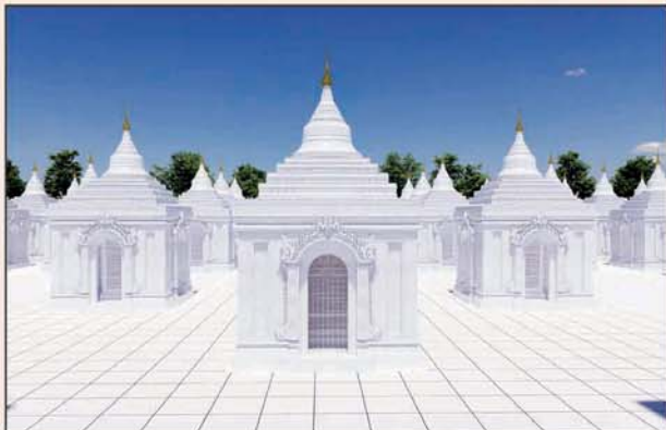
ကျောက်စာရုံစေတီ(၁၂ x ၁၂ x ၁၈)ပေ ၁ ဆူ တန်ဖိုး- ၂၇၉ သိန်း