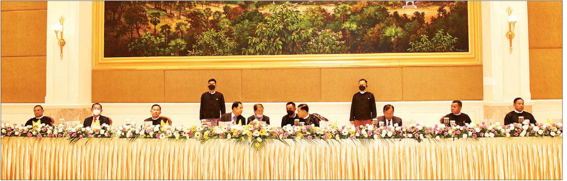
နိုင်ငံတော်စီမံအုပ်ချုပ်ရေးကောင်စီ ဥက္ကဋ္ဌ၊ နိုင်ငံတော်ဝန်ကြီးချုပ် ဗိုလ်ချုပ်မှူးကြီး မင်းအောင်လှိုင် ကမ္ဘောဒီးယားနိုင်ငံ ဝန်ကြီးချုပ် Samdech Akka Moha Sena Padei Techo HUN SEN ဦးဆောင်သော ကိုယ်စားလှယ်အဖွဲ့အား ဂုဏ်ပြုညစာစားပွဲဖြင့် တည်ခင်းညှိနှိုင်းပွဲ။