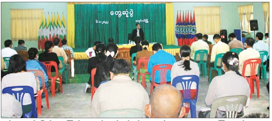
တွင်း ရေနုတ်မြောင်းများ ကြည့်ရှု ကွန်ကရစ်လမ်းနှင့် ရေနုတ်များ များအား မှာကြားသည်။ စစ်ဆေးပြီး လမ်းပိုင်းအလိုက် တူးဖော်သွားရန် တာဝန်ရှိသူ သတင်းစဉ်

သနပ်ပင် ဇန်နဝါရီ ၇ ရှေးဒေသခံမြို့မိမြို့ဖများ၊ အဆင့်မြင့်တင် ဆောင်ရွက်ပေး မြို့နယ်အဆင့် ဌာနဆိုင်ရာများ လျက်ရှိကြောင်း ပြောကြား နှင့်တွေ့ဆုံစဉ် ပြောကြားသည်။ သနပ်ပင်မြို့ ဖွံ့ဖြိုးတိုးတက်ရေး အလိုက် အဆင့်မြင့်တင်ပေးနိုင် ထိုနောက် မြို့နယ်အဆင့်ဌာန ဝန်ကြီးချုပ်က သနပ်ပင်မြို့ သည် (သီလဝါ-သန်လျင်-ခရမ်း- သနပ်ပင် - ပဲခူး)လမ်း ဖြတ်သန်း ရာ မြို့တစ်မြို့ဖြစ်ကာ အနာဂတ် တွင် ကုန်စည်စီးဆင်းမှု အရေး ပါသည့် နေရာတစ်ခု ဖြစ်လာ တွင် ကုန်စည်စီးဆင်းမှု အရေး မည်ဖြစ်၍ ယခုကတည်းက ယင်းနောက် တိုင်းဒေသကြီး ဆောင်ရွက်စရာ ရှိသည်များကို ဝန်ကြီးချုပ်သည် သနပ်ပင်မြို့