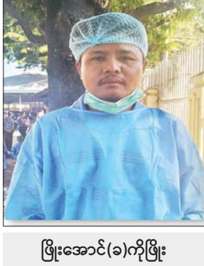
ဖြိုးအောင်(ခ)ကိုဖြိုး