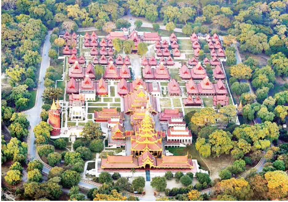
ကျော် အကုန်ကျခံဆောက်လုပ် လွှဲပြောင်းပေးအပ်ခဲ့သည်။ မြန်မာ့ ထိန်းသိမ်းခဲ့ခြင်းဖြစ်ပြီး ဖွင့်ပွဲနေ့ တွင် ရှေးဟောင်းသုတေသနနှင့် အမျိုးသားပြတိုက် ဦးစီးဌာနသို့ လာရောက် လည်ပတ်လိုပါက မန္တလေး၊ အောင်မြေသာစံမြို့နယ် ရှိနန်းမြို့တွင်းသို့ နန်းရှေ့ ၆၆ လမ်း၊ ၁၉ လမ်း၊ ဦးထိပ်တံတားပေါက်မှ ဝင်ရောက် လေ့လာနိုင်ကြောင်း သိရသည်။ မောင်အေးချမ်း

မြန်မာ့စံကျော် ရွှေနန်းတော် ပရိဝုဏ်အတွင်း၌ အမြောက် ပြတိုက်ကို ရှေးဟောင်းအမွေအနှစ် သမိုင်းဝင် အမြောက်များအား တစ်နေရာတည်းတွင် တစ်စု တစ်စည်းတည်း အများပြည်သူ များ လေ့လာနိုင်စေရန် ရည်ရွယ် ၍ တပ်မတော် ကာကွယ်ရေးဦးစီး ချုပ်၏ လမ်းညွှန်ချက်အရ ၂၀၂၀ ပြည့်နှစ် ဩဂုတ် ၂၈ ရက်တွင် ဖွင့်လှစ်ခဲ့ခြင်းဖြစ်သည်။ အဆိုပါ ပြတိုက်အတွင်း ရှေးဟောင်း အမြောက်အလက် ၃၀ နှင့် ဆက်စပ်ပစ္စည်းများကို စနစ်တကျ ခင်းကျင်းပြသထားရှိပြီး တပ်မတော် မှ ငွေကျပ်သိန်းပေါင်း ၃၅၀၀