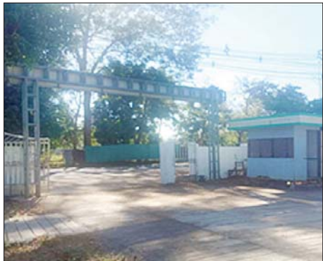
ကျိုက်ထိုမြို့နယ် ကင်မွန်းချောင်းကျေးရွာရှိ အခြေခံပညာအထက်တန်းကျောင်းဝင်ပေါက် လုံခြုံရေးဂိတ်အတွင်း လက်လုပ်မိုင်းတစ်လုံးပေါက်ကွဲမှုနှင့် ထိခိုက်ဒဏ်ရာရရှိသူများ မှတ်တမ်းဓာတ်ပုံ။