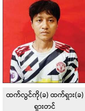
ထက်လွင်ကို(ခ) ထက်ရှား(ခ) ရှားတင်