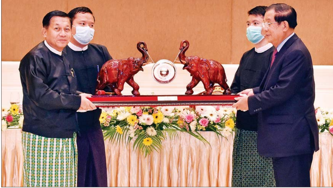
နိုင်ငံတော်စီမံအုပ်ချုပ်ရေးကောင်စီ ဥက္ကဋ္ဌ၊ နိုင်ငံတော်ဝန်ကြီးချုပ် ဗိုလ်ချုပ်မှူးကြီး မင်းအောင်လှိုင်နှင့် ကမ္ဘောဒီးယားနိုင်ငံ ဝန်ကြီးချုပ် Samdech Akka Moha Sena Padei Techo HUN SEN တို့ အမှတ်တရလက်ဆောင်ပစ္စည်းများ အပြန်အလှန် ပေးအပ်ကြစဉ်။

ဆိုင်ရာ ပူးပေါင်းဆောင်ရွက်ရေးဝန်ကြီးဌာန ဒုတိယဝန်ကြီးများဖြစ်ကြသည့် H.E. Dr. SOEUNG Rathchavyနှင့် H.E. Mrs. EAT Sophea ၊ ဒုတိယကာကွယ်ရေးဦးစီးချုပ်နှင့် ကာကွယ်ရေးဦးစီးချုပ် (ကြည်း) Lt. Gen. Hun Manethi မြန်မာနိုင်ငံဆိုင်ရာ ကမ္ဘောဒီးယားနိုင်ငံ သံအမတ်ကြီး H.E. Mr. CHHOUK Bunna နှင့် ကိုယ်စားလှယ်အဖွဲ့ဝင်များ တက်ရောက်ကြသည်။ ဦးစွာနိုင်ငံတော် စီမံအုပ်ချုပ်ရေးကောင်စီဥက္ကဋ္ဌ၊ နိုင်ငံတော်ဝန်ကြီးချုပ်က ကမ္ဘောဒီးယားနိုင်ငံ ဝန်ကြီးချုပ်အား ကြိုဆိုနှုတ်ဆက်ပြီး ညစာစားပွဲအခမ်းအနားသို့ တက်ရောက်လာကြသည့် နိုင်ငံတော်စီမံအုပ်ချုပ်ရေး ကောင်စီ ဒုတိယဥက္ကဋ္ဌ၊ ဒုတိယဝန်ကြီးချုပ်၊ ကောင်စီ တွဲဖက်အတွင်းရေးမှူး၊ ပြည်ထောင်စုဝန်ကြီးများနှင့် မိတ်ဆက်ပေးသည်။