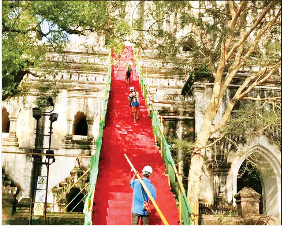
မြန်မာနှစ်ဦးနှစ်ဖက်သည် ပုဂံ၌ သဗ္ဗညုဘုရား ပြုပြင် ထိန်းသိမ်းရေးစာလွှာကို လက်မှတ်ရေးထိုးခဲ့သည်။ ပြုပြင်ထိန်းသိမ်းမှုများ စတင်ဆောင်ရွက်ခဲ့သည်။ ၂၀၁၉ ခုနှစ် ဧပြီလတွင် စန်ရှီးပညာရှင်အဖွဲ့ မြန်မာ နိုင်ငံသို့ ရောက်ရှိခဲ့ပြီး သဗ္ဗညုဘုရား အရေးပေါ် ထိန်းသိမ်းရေးစာလွှာကို လက်မှတ်ရေးထိုးခဲ့သည်။ ပြုပြင်ထိန်းသိမ်းမှုများ စတင်ဆောင်ရွက်ခဲ့သည်။ သိရ