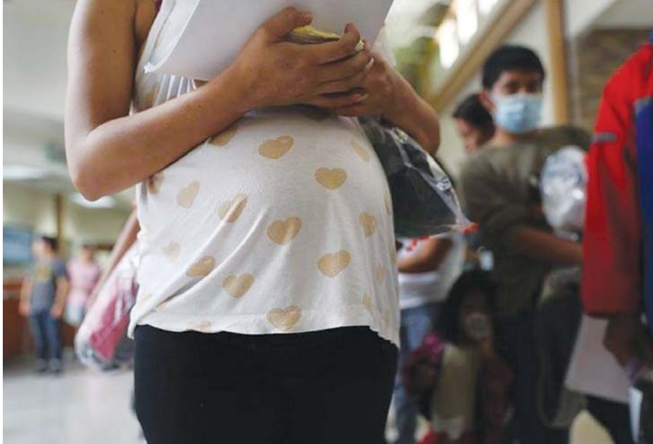
ကုလသမဂ္ဂ ကလေးများရန်ပုံငွေအဖွဲ့၏ ပြီးခဲ့ ပါးကျော်မှာ ကလေးဘဝကပင် လက်ထပ်ပေးခြင်း သည့်နှစ် အစီရင်ခံစာအရ ကမ္ဘာတစ်ဝန်းရှိ ခံရသည်ဟု သိရသည်။ မိန်းကလေးငယ်နှင့် အမျိုးသမီး ဘီလီယံတစ်ဝက်နီး အေအက်ဖီပီ

သည့် ဥပဒေကို ဖိလစ်ပိုင်သမ္မတ ရိုဒရီဂိုဒူတာတေးက လက်မှတ်ရေးထိုးခဲ့ပြီး ဇန်နဝါရီ ၆ ရက်က ထုတ်ပြန်ခဲ့ ရာ ယင်းဥပဒေအောက်တွင် အသက် ၁၈ နှစ်အောက် မည်သူနှင့်မဆို လက်ထပ်ဘဲ အတူနေခြင်း သို့မဟုတ် လက်ထပ်ခြင်းပြုလုပ်ပါက ထောင်ဒဏ် ၁၂ နှစ်အထိ ချမှတ်နိုင်ကြောင်း သိရသည်။ ယခု ထုတ်ပြန်ခဲ့သည့် ဥပဒေတွင် အမျိုးသမီး များနှင့် ကလေးသူငယ်များအခွင့်အရေးနှင့် သက်ဆိုင်သော အပြည်ပြည်ဆိုင်ရာ လုပ်ထုံး လုပ်နည်းများပါဝင်သည်ဟုလည်း အစိုးရကပြော သည်။ အချို့သောတိုင်းရင်းသား အုပ်စုများနှင့် မူဆလင်အသိုင်းအဝိုင်းများတွင် ကလေးသူငယ် လက်ထပ်ပေးခြင်းမှာ မကြာခဏတွေ့မြင်နေရသည့် ကိစ္စဖြစ်နေပြီး ယင်းအသိုင်းအဝိုင်းများအတွက် အကူးအပြောင်းကာလအဖြစ် အချိန်တစ်နှစ်ဆိုင်ခွဲ ပေးကြောင်း သိရသည်။