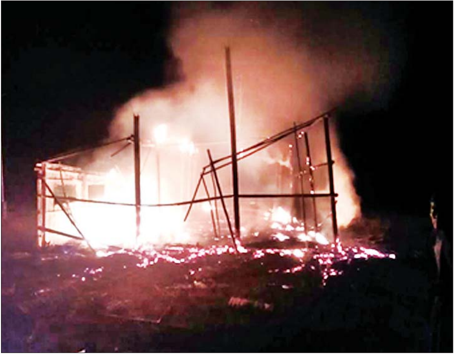
ဆူပူအကြမ်းဖက်သူများက မီးရှို့မှုကြောင့် မြောင်းမြမြို့နယ် ကံကုန်းကျေးရွာရှိ ကိုယ့်အားကိုယ်ကိုး မူလတန်းကျောင်း မီးလောင်ပျက်စီးမှု မှတ်တမ်းဓာတ်ပုံ။