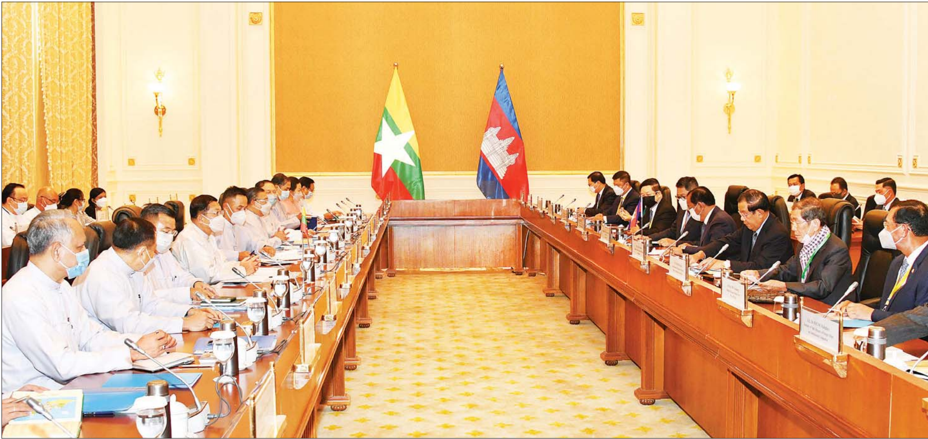
မြန်မာ - ကမ္ဘောဒီးယား နှစ်နိုင်ငံ တွေ့ဆုံဆွေးနွေးပွဲ ကျင်းပစဉ်။