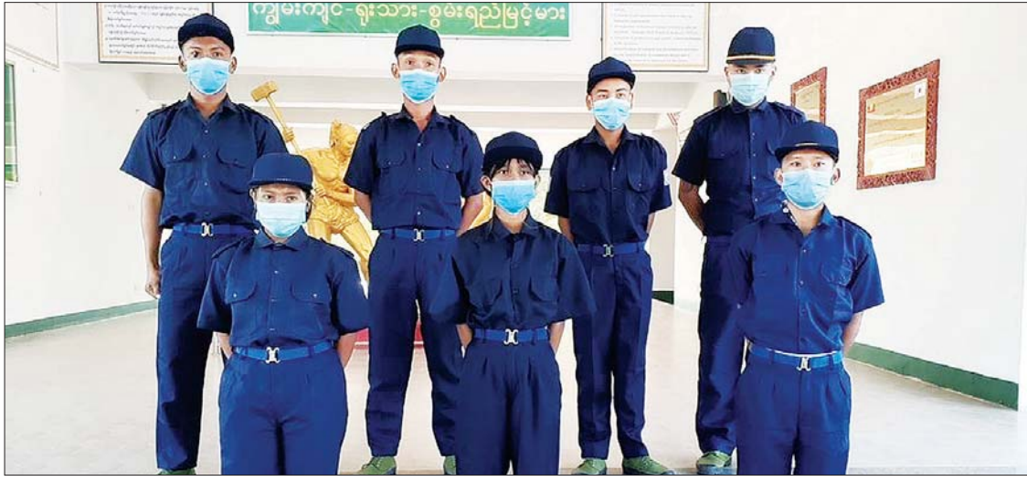
စက်မှုသင်တန်းကျောင်း တက်ခွင့်ရရှိသည့် လူငယ်ခုနစ်ဦး။

မင်းဘူး ဇန်နဝါရီ ၇ မြန်မာ့ရေနံနှင့် သဘာဝဓာတ်ငွေ့လုပ်ငန်း နှင့် အကျိုးတူပူးပေါင်းဆောင်ရွက်လျက် ရှိသည့် MPRL E&P သည် မန်းရေနံမြေ ဒေသခံလူငယ်များ အသက်မွေးဝမ်း ကျောင်းအတတ်ပညာများကို သင်ယူခွင့် ရရှိနိုင်ရန် ဒေသတွင်းပညာရေးဆိုင်ရာ အဖွဲ့အစည်းများနှင့် ပူးပေါင်းဆောင် ရွက်ခဲ့ပြီး ၂၀၂၀ ပြည့်နှစ် ဧပြီလမှစတင်၍ ကိုဗစ်-၁၉ ရောဂါ ကာကွယ်၊ တားဆီး၊ ထိန်းချုပ်ရေးစီမံချက်များကို ပူးပေါင်း လိုက်နာသည့်အနေဖြင့် အဆိုပါအစီအစဉ် များကို ယာယီရပ်နားခဲ့ရာ ၂၀၂၁ ခုနှစ် နိုဝင်ဘာလတွင် သက်ဆိုင်ရာ အဖွဲ့ အစည်းများ၏ ခွင့်ပြုချက်ဖြင့် လုပ်ငန်း ပြန်လည်စတင်ခဲ့သည်။