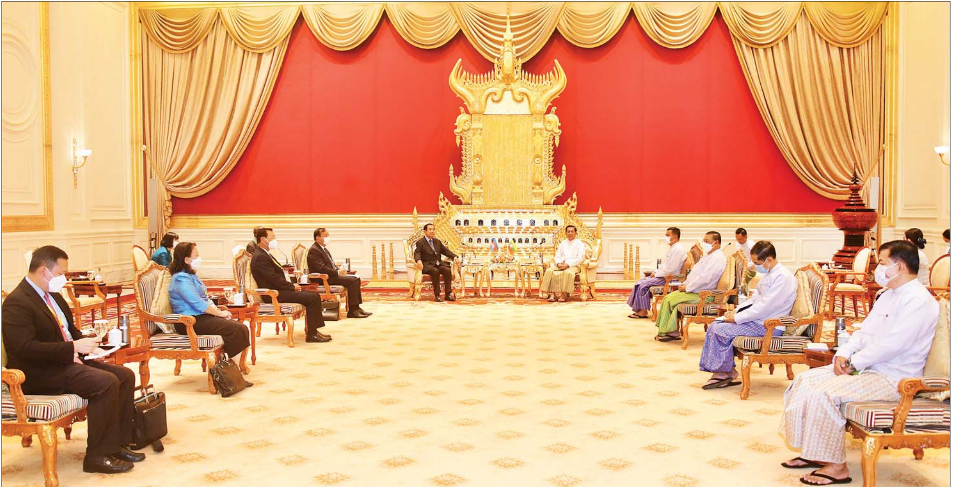
နိုင်ငံတော်စီမံအုပ်ချုပ်ရေးကောင်စီဥက္ကဋ္ဌ၊ နိုင်ငံတော်ဝန်ကြီးချုပ် ဗိုလ်ချုပ်မှူးကြီး မင်းအောင်လှိုင် နှင့် ကမ္ဘောဒီးယားနိုင်ငံဝန်ကြီးချုပ် Samdech Akka Moha Sena Padei Techo HUN SEN တို့ တွေ့ဆုံဆွေးနွေးစဉ်။