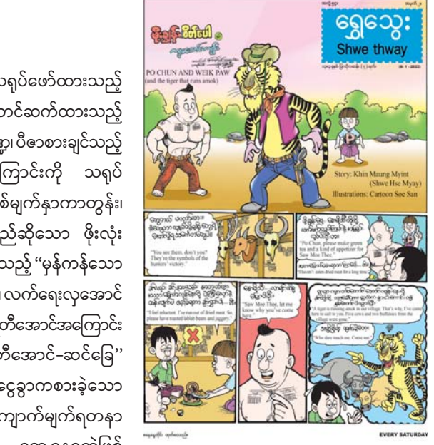
အင်္ဂလိပ်စကားပိုင်းကဏ္ဍနှင့် ကဗျာကဏ္ဍ စုံလင်စွာဖြင့် ထွက်ရှိပြန်သည်။ သတင်းစဉ်

နေပြည်တော် ဇန်နဝါရီ ၇ - ပြန်ကြားရေးဝန်ကြီးဌာန ပုံနှိပ်ရေးနှင့်ထုတ်ဝေရေးဦးစီးဌာန စာပေဗိမာန်ရုံးက အပတ်စဉ် စနေနေ့တိုင်း ရွှေသွေးဂျာနယ်ကို ထုတ်ဝေဖြန့်ချိလျက်ရှိသည်။ ၂၀၂၂ ခုနှစ် ဇန်နဝါရီ ၈ ရက် (စနေနေ့) တွင် ထွက်ရှိမည့်ရွှေသွေးဂျာနယ် အတွဲ ၅၄၊ အမှတ် (၂)၅ ကျားသောင်းကျန်းကြီးကို အဓိကဖော်ပြထားသော ဖိုးချွန်းနှင့် ဆရာတပည့်အကြောင်းကို တင်ဆက်ထားသည့် "ဖိုးချွန်း၊ ဝိတ်ပေါနှင့် ကျားသောင်းကျန်း" မျက်နှာဖုံးကားတွင် ယဉ်ကျေးမှုအလွမ်းမိုးဆိုးနိုင်ငံသုံးနိုင်ငံအကြောင်းကို ဗဟုသုတဖြစ်ဖွယ် တင်ဆက်ထားသည့် "ယဉ်ကျေးမှုအလွမ်းမိုးဆိုး ကမ္ဘာသုံးနိုင်ငံ" သုတ ဆောင်းပါး၊ ကလေး