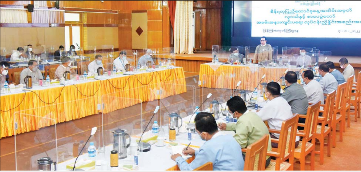
ပြန်ကြားရေးဝန်ကြီးဌာန ပြည်ထောင်စုဝန်ကြီး ဦးမောင်မောင်အုန်း (၇၅)နှစ်မြောက် စိန်ရတုပြည်ထောင်စုနေ့ အထိမ်းအမှတ် လူငယ်နှင့် စာပေပွဲတော်အခမ်းအနားကျင်းပရေး လုပ်ငန်းညှိနှိုင်းအစည်းအဝေးတွင် အမှာစကားပြောကြားစဉ်။

ပွဲတော်ကျင်းပရာတွင် မိမိတို့ ဝန်ကြီးဌာနက စာပေနှင့် ပတ်သက်၍ စာအုပ် စာစောင်များ ခင်းကျင်းပြသခြင်း၊ စာပေဗိမာန် စာအုပ်အရောင်းဆိုင် ဖွင့်လှစ်၍ စာအုပ်၊ စာစောင်များ ရောင်းချခြင်း၊ စာရေးဆရာကြီးများ၏ ဓာတ်ပုံများ ခင်းကျင်းပြသခြင်း ၊ ကလေးစာဖတ်ခန်း ဖွင့်လှစ်ပေးခြင်း၊ လေကြောင်းပညာရပ်ဆိုင်ရာ သရုပ်ပြသခြင်း၊ သမိုင်းဝင်စာချုပ် စာတမ်းများ၊ မှတ်တမ်းများ ခင်းကျင်းပြသခြင်း၊ အားကစား လှုပ်ရှားမှုပြခန်း၊ ကာတွန်းဓာတ်ပုံ ပြခန်းပြသခြင်းနှင့် သိပ္ပံနှင့် နည်းပညာဝန်ကြီးဌာန ပြခန်းများ ပြသခြင်းများ ဆောင်ရွက်မည် ဖြစ်ပါကြောင်း၊ ထူးထူးခြားခြား အနေဖြင့် မြန်မာနိုင်ငံ လေကြောင်း ဝါသနာရှင်များ အသင်း၏ လေကြောင်းပညာရပ်ဆိုင်ရာ သရုပ်ပြသခြင်းကိုလည်း ထည့်သွင်းထားပါကြောင်း။