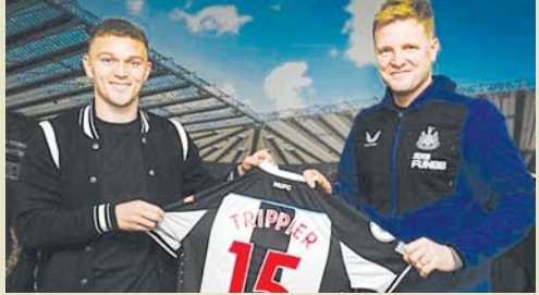
■ မိုးဇက် - စုစည်းသည်

ပရီမီယာလိဂ်ကလပ် နယူးကာဆယ်အသင်းသည် အက်သလက်တီကိုမက်ဒရစ်အသင်းမှ အင်္ဂလန်ခံစစ်ကစားသမား ထရစ်ပီယာကို အပြီးသတ်ခေါ်ယူလိုက်ပြီဖြစ်သည်။ အဆိုပါ ၃၁ နှစ်အရွယ် ခံစစ်ကစားသမား ထရစ်ပီယာသည် အသင်းပိုင်ရှင်သစ်လက်ထက်တွင် ပထမဆုံး ခေါ်ယူသည့် ကစားသမားဖြစ်လာခဲ့သလို နည်းပြဟိုက်လက်ထက်တွင်လည်း ပထမဆုံးခေါ်ယူသည့် ကစားသမား ဖြစ်လာခဲ့သည်။ နယူးကာဆယ်အသင်းသည် အဆိုပါ ခံစစ်ကစားသမားကို တစ်နှစ်သက်တမ်းတိုးခွင့်အပါအဝင် နှစ်နှစ်ခွဲ စာချုပ်ဖြင့် ခေါ်ယူခဲ့ခြင်း ဖြစ်သည်။ နယူးကာဆယ်အသင်းသည် ပရီမီယာလိဂ် ၁၉ ပွဲတွင် တစ်ပွဲသာ နိုင်ပွဲရရှိထားပြီး ရှစ်ပွဲသာကျကျ ၁၀ ပွဲအထိ ရှုံးနိမ့်ထားသည့်အတွက် ရမှတ် ၁၁ မှတ်ဖြင့် တန်းဆင်း ဇုန်အတွင်း ရပ်တည်နေသည့်အသင်းဖြစ်သည်။ ထို့အပြင် နယူးကာဆယ်အသင်းသည် အဆိုပါ ၁၉ ပွဲတွင် ပေးဂိုးက ၄၂ ဂိုးအထိရှိနေသည့်အတွက် ယခုနှစ်ရာသီ ပရီမီယာလိဂ်တွင် ခံစစ်အဆိုးရွားဆုံးအသင်းအဖြစ် ရှိနေခြင်းလည်း ဖြစ်သည်။