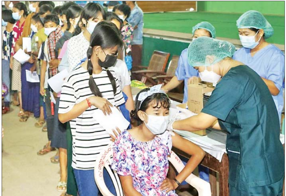
၂၀၂၁ခုနှစ်နိုဝင်ဘာလ ၂၅ရက်ကမကွေးတိုင်းဒေသကြီးပခုက္ကူမြို့နယ်၌ကျောင်းနေရွယ်ကလေးတိုင်း ကျန်းမာပျော်ရွှင်စွာပညာသင်ကြားနိုင်ရန် ကိုဗစ်-၁၉ ရောဂါ ကာကွယ်ဆေးထိုးကြပါစို့ ဆောင်ပုဒ်နှင့် အညီ အခြေခံပညာ ကျောင်းများတွင် ပညာသင်ကြားလျက်ရှိသည့် အသက် ၁၂ နှစ်အထက် ကျောင်းသား ကျောင်းသူများအား အမှတ် (၁) နှင့် (၄) အခြေခံပညာအထက်တန်းကျောင်း၌ ကိုဗစ်- ၁၉ ကာကွယ်ဆေး ဒုတိယအကြိမ် ထိုးနှံပေးစဉ်။

နိုင်ငံတော်အစိုးရက နိုင်ငံတော်ဝန်ကို ထမ်းဆောင်သည့် ဆယ်လပြည့်မြောက် သည့် နိုဝင်ဘာလအတွင်း ပြည်သူ့ အတွက်လုပ်ဆောင်ချက်များကား ယခု ထက်ပို၍များပြားစွာ ရှိနေပါသေးသည်။ လာမည့်ကာလများတွင်လည်း အစိုးရနှင့် ပြည်သူ တွဲလက်ညီစွာဖြင့် မည်သည့် စိန်ခေါ်မှုမျိုးကိုမဆို ကျော်ဖြတ်အနိုင်ယူ ရင်း စည်းကမ်းပြည့်ဝသည့် ဒီမိုကရေစီ နိုင်ငံတော်ကြီးဆီသို့ လျှောက်လှမ်းသွား ကြရမည်သာဖြစ်ပါတော့သည်။ ။