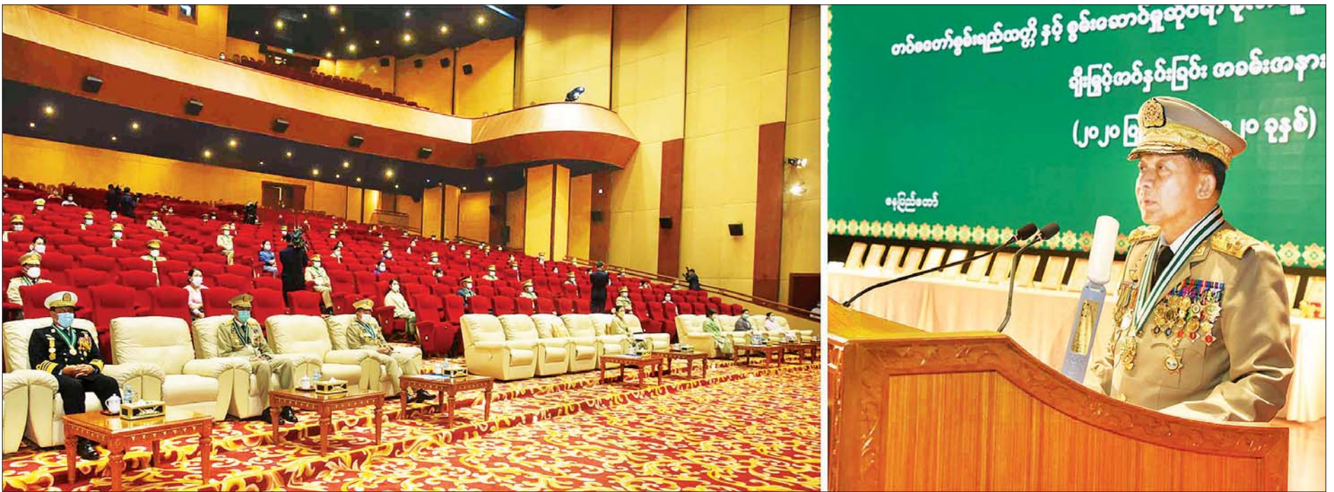
နိုင်ငံတော်စီမံအုပ်ချုပ်ရေးကောင်စီဥက္ကဋ္ဌ၊ တပ်မတော်ကာကွယ်ရေးဦးစီးချုပ် ဗိုလ်ချုပ်မှူးကြီး မဟာသရေစည်သူ မင်းအောင်လှိုင် တပ်မတော်စွမ်းရည်သတ္တိနှင့် စွမ်းဆောင်မှုဆိုင်ရာဂုဏ်ထူးဆောင်တံဆိပ်နှင့် လက်မှတ်များ ချီးမြှင့်အပ်နှင်းခြင်းအခမ်းအနားတွင် အမှာစကားပြောကြားစဉ်။