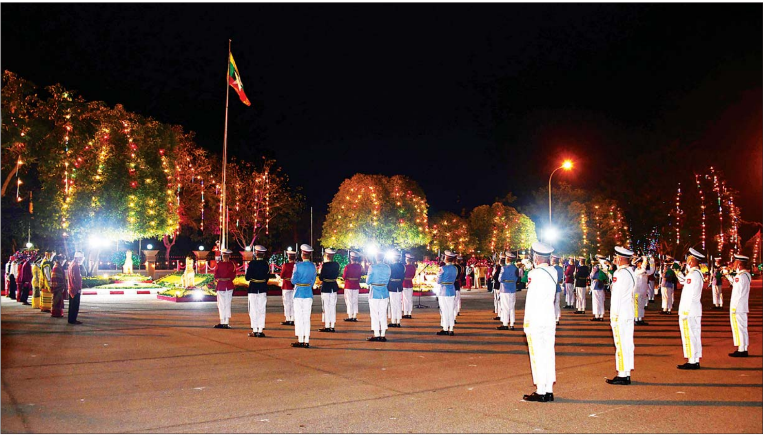
နေပြည်တော် မြို့တော်ခန်းမရှေ့ပြင်၌ ၂၀၂၂ ခုနှစ် (၇၄) နှစ်မြောက် လွတ်လပ်ရေးနေ့ နိုင်ငံတော်အလံတင် အခမ်းအနားကိုကျင်းပရာ အလံတင်တစ်စုက တိုင်းရင်းသား တိုင်းရင်းသူများ ခြံရံ၍ နိုင်ငံတော်အလံကို လွှင့်တင်စဉ်။

ထို့နောက် နံနက် ၆ နာရီတွင် ပြည်ထောင်စု ဝန်ကြီးများ၊ ပြည်ထောင်စု စာရင်းစစ်ချုပ်၊ နေပြည်တော်ကောင်စီ ဥက္ကဋ္ဌ၊ မြန်မာနိုင်ငံတော်ဗဟိုဘဏ်ဥက္ကဋ္ဌ၊ မြန်မာနိုင်ငံ အမျိုးသားလူ့အခွင့်အရေးကော်မရှင်ဥက္ကဋ္ဌ၊ တပ်မတော် အရာရှိကြီးများ၊ ပြည်ထောင်စု တရားလွှတ်တော်ချုပ် တရားသူကြီးများ၊ နိုင်ငံတော်ဖွဲ့စည်းပုံ