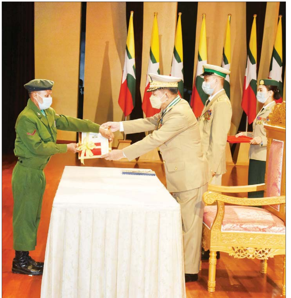
နိုင်ငံတော် စီမံအုပ်ချုပ်ရေးကောင်စီဥက္ကဋ္ဌ၊ တပ်မတော်ကာကွယ်ရေးဦးစီးချုပ် ဗိုလ်ချုပ်မှူးကြီး မဟာသရေစည်သူ မင်းအောင်လှိုင် သူရဲကောင်းမှတ်တမ်းဝင်တံဆိပ်ရရှိသူတစ်ဦးအား ဆုတံဆိပ်ပေးအပ်ချီးမြှင့်စဉ်။