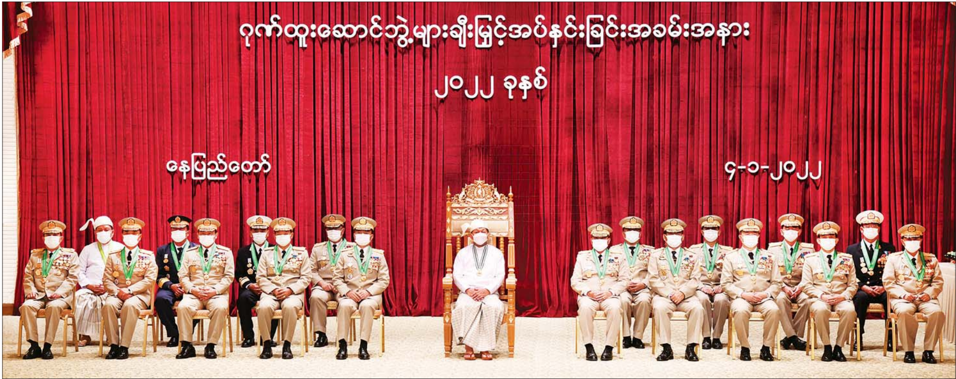
နိုင်ငံတော်စီမံအုပ်ချုပ်ရေးကောင်စီဥက္ကဋ္ဌ၊ နိုင်ငံတော်ဝန်ကြီးချုပ် ဗိုလ်ချုပ်မှူးကြီး မဟာသရေစည်သူ မင်းအောင်လှိုင် ဇေယျကျော်ထင်ဘွဲ့၊ ဝဏ္ဏကျော်ထင်ဘွဲ့ရရှိသူများနှင့်အတူ စုပေါင်းမှတ်တမ်းတင် ဓာတ်ပုံရိုက်စဉ်။

စာမျက်နှာ ၄ မှ ဒုတိယဥက္ကဋ္ဌ၊ ဒုတိယဝန်ကြီးချုပ် ဒုတိယဗိုလ်ချုပ်မှူးကြီး စိုးဝင်းကိုလည်းကောင်း၊ စည်သူဘွဲ့ရရှိကြသူများကိုယ်စား ကောင်စီဝင် ဗိုလ်ချုပ်ကြီး မြထွန်းဦးကိုလည်းကောင်း၊ တပ်မတော်ဆိုင်ရာ စွမ်းရည်သတ္တိ ဂုဏ်ထူးဆောင်ဘွဲ့ဖြစ်သည့် သူရဘွဲ့ရရှိသူ အမှတ် (၂၀၇)ခြေမြန်တပ်ရင်းမှ ဒုတိယတပ်ကြပ် သက်ရှည်ကိုယ်စား ၎င်း၏ဇနီးကိုလည်းကောင်း၊ စွမ်းဆောင်မှုဆိုင်ရာ ဂုဏ်ထူးဆောင်ဘွဲ့များဖြစ်သည့် ဇေယျကျော်ထင်ဘွဲ့ရရှိကြသူ ၁၇ ဦးကိုယ်စား ဒုတိယဗိုလ်ချုပ်ကြီး ကျော်စွာလင်း ကိုလည်းကောင်း၊ ဝဏ္ဏကျော်ထင်ဘွဲ့ရရှိကြသူ နှစ်ဦးကိုယ်စား ဦးမောင်ကိုကိုလည်းကောင်း ဂုဏ်ထူးဆောင်ဘွဲ့နှင့် တံဆိပ်များ ပေးအပ်ချီးမြှင့်သည်။ ထို့နောက် နိုင်ငံတော်စီမံအုပ်ချုပ်ရေးကောင်စီဥက္ကဋ္ဌ၊ နိုင်ငံတော်ဝန်ကြီးချုပ်သည် ဂုဏ်ထူးဆောင်ဘွဲ့ရရှိသူများ၊ ၎င်းတို့၏ မိသားစုဝင်များနှင့်အတူ မှတ်တမ်းတင် စုပေါင်းဓာတ်ပုံရိုက်ကြသည်။ အခမ်းအနားအပြီးတွင် နိုင်ငံတော်ဝန်ကြီးချုပ်သည် အခမ်းအနားသို့ တက်ရောက်ကြသူများ၊ ဂုဏ်ထူးဆောင်ဘွဲ့ရရှိကြသူများနှင့် ၎င်းတို့၏ မိသားစုဝင်များကို ရင်းရင်းနှီးနှီး နှုတ်ဆက်ခဲ့ကြောင်း သတင်းစဉ်