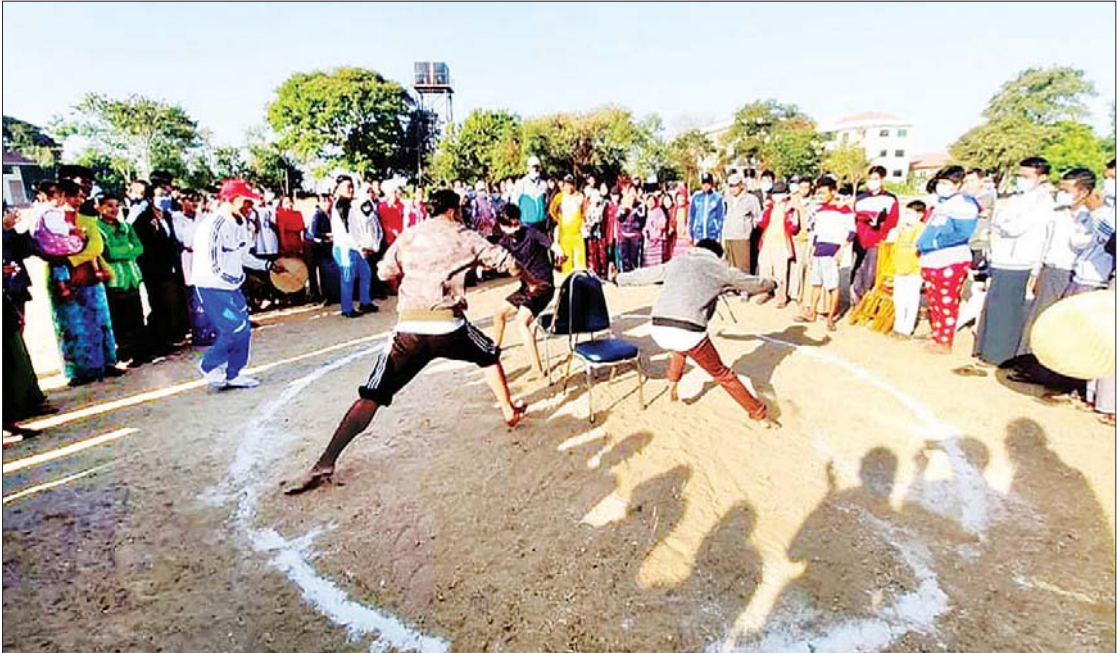
စာမျက်နှာ ၁၂ ကော်လံ ၁ ❖

ရေနံချောင်း ဇန်နဝါရီ ၄ မကွေးတိုင်းဒေသကြီး ရေနံချောင်းတက္ကသိုလ်ရှိ ဘောလုံးအားကစားကွင်း၌ (၇၄)နှစ်မြောက် လွတ်လပ်ရေးနေ့ အထိမ်းအမှတ်အားကစားပြိုင်ပွဲများကို ယနေ့နံနက် ၇ နာရီက စည်ကားစွာ ကျင်းပပြုလုပ်သည်။ (အောက်ပုံ)