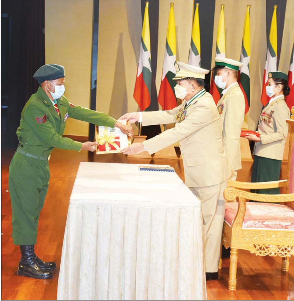
နိုင်ငံတော် စီမံအုပ်ချုပ်ရေးကောင်စီဥက္ကဋ္ဌ၊ တပ်မတော်ကာကွယ်ရေးဦးစီးချုပ် ဗိုလ်ချုပ်မှူးကြီး မဟာသရေစည်သူ မင်းအောင်လှိုင် သူရဲကောင်းမှတ်တမ်းဝင်တံဆိပ်ရရှိသူတစ်ဦးအား ဆုတံဆိပ်ပေးအပ်ချီးမြှင့်စဉ်။

မသမာမှုဖြစ်သော မဲမသမာမှု ဖြစ်စဉ်များကြောင့် တပ်မတော်က (၂၀၀၈ ခုနှစ်) ဖွဲ့စည်းပုံအခြေခံဥပဒေနှင့်အညီ နိုင်ငံတော်တာဝန်အရပ်ရပ်ကို ခေတ္တထိန်းသိမ်းပေးခဲ့ရသည်မှာ ယခုဆိုပါက ၁ နှစ်သက်တမ်းပြည့်မြောက်တော့မည်ပင်ဖြစ်ကြောင်း၊ နိုင်ငံတော်စီမံအုပ်ချုပ်ရေး ကောင်စီအနေဖြင့် ရှေ့လုပ်ငန်းစဉ်များ၊ ဦးတည်ချက်များ ချမှတ်ပြီး နိုင်ငံတော်ကို လမ်းကြောင်းမှန်ပေါ် ပြန်လည်