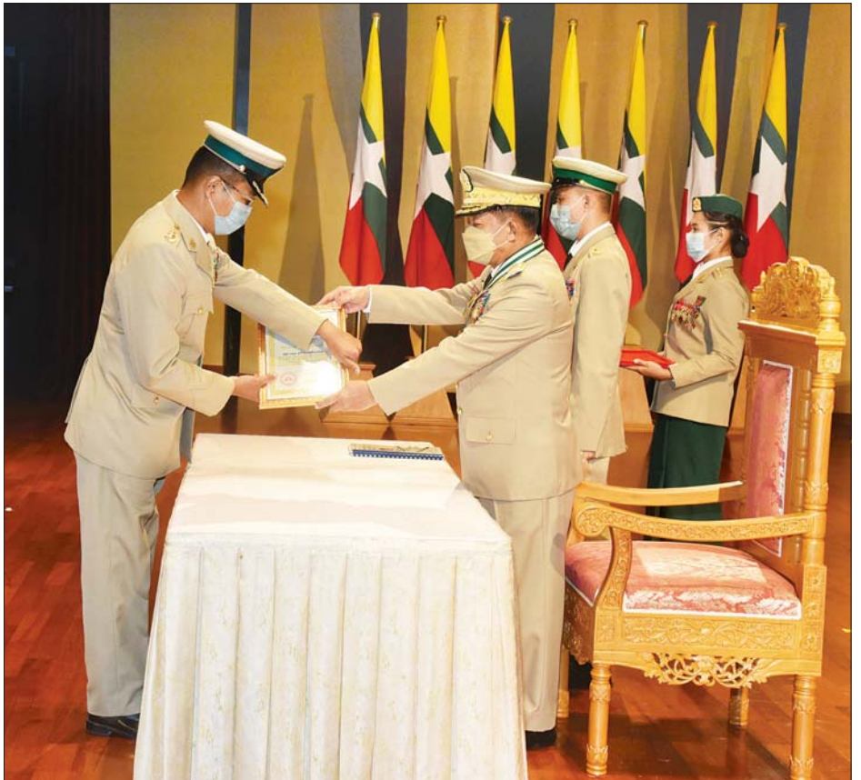
နိုင်ငံတော်စီမံအုပ်ချုပ်ရေးကောင်စီဥက္ကဋ္ဌ၊ တပ်မတော်ကာကွယ်ရေးဦးစီးချုပ် ဗိုလ်ချုပ်မှူးကြီး မဟာသရေစည်သူ မင်းအောင်လှိုင် သိပ္ပံပညာထူးချွန်တံဆိပ်(ပထမအဆင့်)ရရှိသူတစ်ဦးအား ဆုတံဆိပ် ပေးအပ်ချီးမြှင့်စဉ်။

ဦးစီးချုပ် ဗိုလ်ချုပ်မှူးကြီး မဟာသရေစည်သူ မင်းအောင်လှိုင်နှင့်အတူ ဇနီး ဒေါ်ကြူကြူလှ၊ နိုင်ငံတော်စီမံအုပ်ချုပ်ရေးကောင်စီ ဒုတိယဥက္ကဋ္ဌ၊ ဒုတိယ တပ်မတော် ကာကွယ်ရေးဦးစီးချုပ် ကာကွယ်ရေး ဦးစီးချုပ်(ကြည်း) ဒုတိယဗိုလ်ချုပ်မှူးကြီး သရေစည်သူ စိုးဝင်းနှင့်ဇနီး ဒေါ်သန်းသန်းနွယ်၊ ပြည်ထောင်စုဝန်ကြီးများနှင့်ဇနီးများ၊ ကာကွယ်ရေး ဦးစီးချုပ်(ရေ)နှင့်ဇနီး၊ ကာကွယ်ရေးဦးစီးချုပ်(လေ) နှင့်ဇနီး၊ ကာကွယ်ရေးဦးစီးချုပ်ရုံးမှ တပ်မတော် အရာရှိကြီးများနှင့်ဇနီးများ၊ တပ်မတော် စွမ်းရည် သတ္တိနှင့် စွမ်းဆောင်မှုဆိုင်ရာ ဂုဏ်ထူးဆောင် တံဆိပ်နှင့် လက်မှတ်လက်ခံရယူကြမည့် အရာရှိ၊ စစ်သည်များနှင့် အမွေခံများ တက်ရောက်ကြသည်။