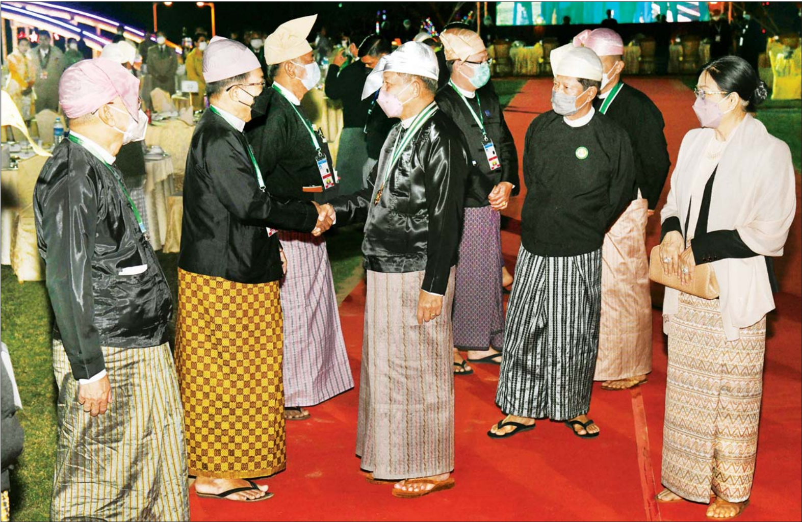
နိုင်ငံတော်စီမံအုပ်ချုပ်ရေးကောင်စီ ဥက္ကဋ္ဌ၊ နိုင်ငံတော်ဝန်ကြီးချုပ် ဗိုလ်ချုပ်မှူးကြီး မင်းအောင်လှိုင်နှင့် ဇနီး ဒေါ်ကြူကြူလှ တို့ (၇၄) နှစ်မြောက် လွတ်လပ်ရေးနေ့ အထိမ်းအမှတ် ဂုဏ်ပြုညစာစားပွဲ အခမ်းအနားသို့ တက်ရောက်လာကြသည့် နိုင်ငံရေးပါတီများမှ ဥက္ကဋ္ဌများနှင့် ကိုယ်စားလှယ်များအား ရင်းရင်းနှီးနှီး လိုက်လံနှုတ်ဆက်စဉ်။

အခမ်းအနားသို့ နိုင်ငံတော်စီမံအုပ်ချုပ်ရေးကောင်စီ ဒုတိယဥက္ကဋ္ဌ၊ ဒုတိယဝန်ကြီးချုပ် ဒုတိယဗိုလ်ချုပ်မှူးကြီး စိုးဝင်း၊ နိုင်ငံတော်စီမံအုပ်ချုပ်ရေး ကောင်စီအဖွဲ့ဝင်များဖြစ်ကြသည့် ဗိုလ်ချုပ်ကြီး မြထွန်းဦး၊ ဗိုလ်ချုပ်ကြီး တင်အောင်စန်း၊ ဗိုလ်ချုပ်ကြီး မောင်မောင်ကျော်၊ ဒုတိယဗိုလ်ချုပ်ကြီး မိုးမြင့်ထွန်း၊ မန်းငြိမ်းမောင်၊ ဦးသိန်းညွန့်၊ ဦးခင်မောင်ရွှေ၊ ဒေါ်အေးနုစိန်၊ Jeng Phang နော်တောင်၊ ဦးမောင်းဟာ၊ ဦးစိုင်းလုံးဆိုင်၊ စောဒန်နီယယ်၊ ဒေါက်တာ ဗညားအောင်မိုး၊ ဒုတိယဗိုလ်ချုပ်ကြီး စိုးထွန်း၊ ဦးရွှေကြိမ်း၊ ကောင်စီအတွင်းရေးမှူး ဒုတိယဗိုလ်ချုပ်ကြီးအောင်လင်းဒွေး၊ ကောင်စီတွဲဖက်အတွင်းရေးမှူး ဒုတိယဗိုလ်ချုပ်