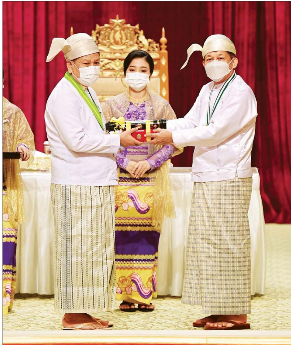
နိုင်ငံတော်စီမံအုပ်ချုပ်ရေးကောင်စီဥက္ကဋ္ဌ၊ နိုင်ငံတော်ဝန်ကြီးချုပ် ဗိုလ်ချုပ်မှူးကြီး မဟာသရေစည်သူ မင်းအောင်လှိုင် ဇေယျကျော်ထင်ဘွဲ့ ရရှိကြသူ ၁၇ဦး ကိုယ်စား ဒုတိယဗိုလ်ချုပ်ကြီး ကျော်စွာလင်း အား ဂုဏ်ထူးဆောင်ဘွဲ့နှင့် တံဆိပ် ပေးအပ်ချီးမြှင့်စဉ်။