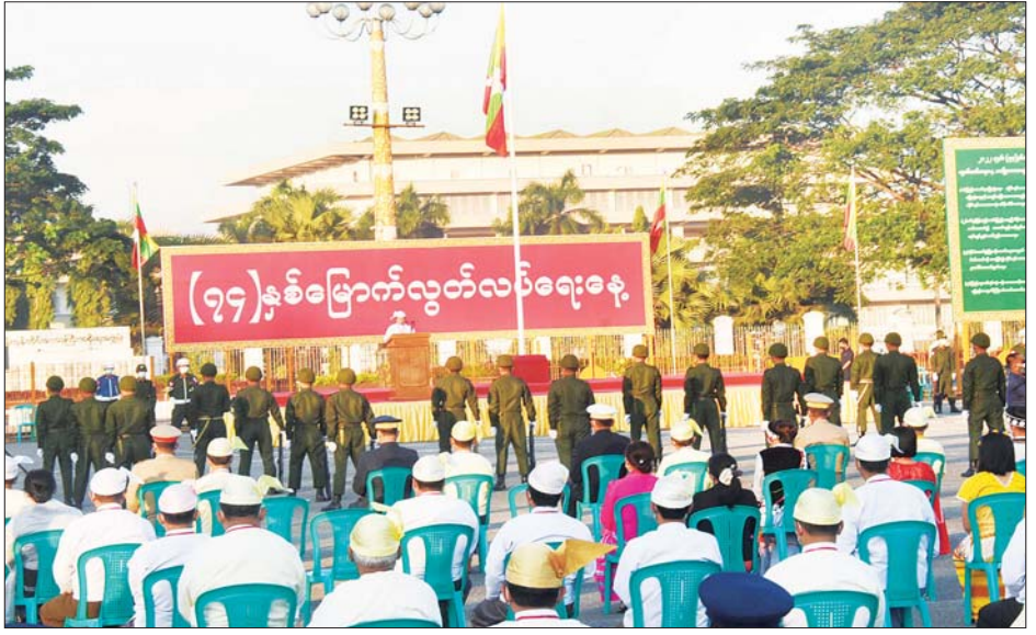
တပ်မတော်အရာရှိကြီးများ၊ ဌာန ဆိုင်ရာ တာဝန်ရှိသူများ၊ မြန်မာနိုင်ငံ မိခင်နှင့်ကလေး စောင့်ရှောက်ရေးအသင်း၊ မြန်မာ ဖိတ်ကြားထားသူများ တက်ရောက် နိုင်ငံ အမျိုးသမီးရေးရာအဖွဲ့၊ ကြသည်။ သတင်း - ကိုကိုဇော် တိုင်းရင်းသား၊ တိုင်းရင်းသူများနှင့်

နိုင်ငံတော်ဝန်ကြီးချုပ် ဗိုလ်ချုပ် များကြီး မင်းအောင်လှိုင်မှ ပေးပို့ သော (၇၄)နှစ်မြောက် လွတ်လပ် ရေးနေ့ သဝဏ်လွှာကို တိုင်းဒေသ ကြီး ဝန်ကြီးချုပ်ဦးလှစိုးက ဖတ် ကြားသည်။ နိုင်ငံတော်အလံ အလေးပြုပွဲ အခမ်းအနားသို့ ရန်ကုန်တိုင်း စစ်ဌာနချုပ် တိုင်းမှူး ဗိုလ်ချုပ် ညွှန်ကြားရေးမှူးချုပ် ဦးလှစိုးက တရားလွတ်တော် တရားသူကြီး ချုပ်၊ တိုင်းဒေသကြီးဝန်ကြီးများ၊ တိုင်းဒေသကြီး ဥပဒေချုပ်၊ တိုင်းဒေသကြီး စာရင်းစစ်ချုပ်၊