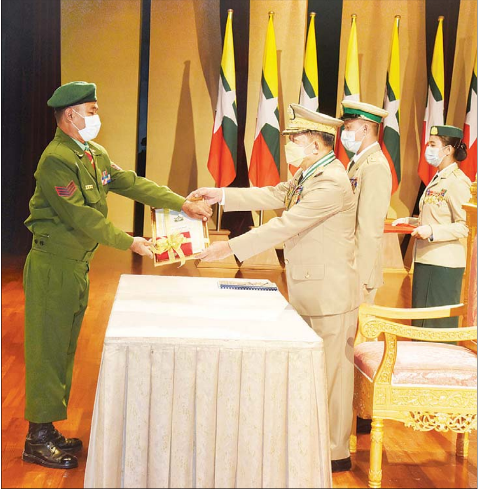
နိုင်ငံတော် စီမံအုပ်ချုပ်ရေးကောင်စီဥက္ကဋ္ဌ၊ တပ်မတော်ကာကွယ်ရေးဦးစီးချုပ် ဗိုလ်ချုပ်မှူးကြီး မဟာသရေစည်သူ မင်းအောင်လှိုင် သူရဲကောင်းမှတ်တမ်းဝင်တံဆိပ်ရရှိသူတစ်ဦးအား ဆုတံဆိပ်ပေးအပ်ချီးမြှင့်စဉ်။