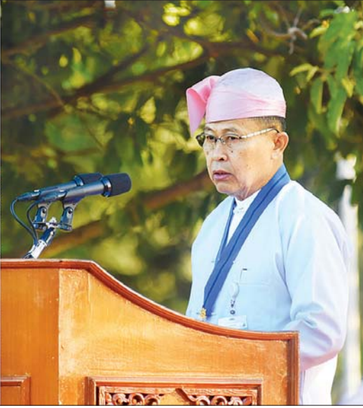
နိုင်ငံတော်စီမံအုပ်ချုပ်ရေးကောင်စီ ဒုတိယဥက္ကဋ္ဌ၊ ဒုတိယဝန်ကြီးချုပ် ဒုတိယဗိုလ်ချုပ်မှူးကြီးစိုးဝင်း နိုင်ငံတော်စီမံအုပ်ချုပ်ရေးကောင်စီဥက္ကဋ္ဌ၊ နိုင်ငံတော် ဝန်ကြီးချုပ် ဗိုလ်ချုပ်မှူးကြီး မင်းအောင်လှိုင်ထံမှ (၇၄) နှစ်မြောက် လွတ်လပ်ရေးနေ့ အခမ်းအနားသို့ ပေးပို့သည့် သဝဏ်လွှာကို ဖတ်ကြားစဉ်။