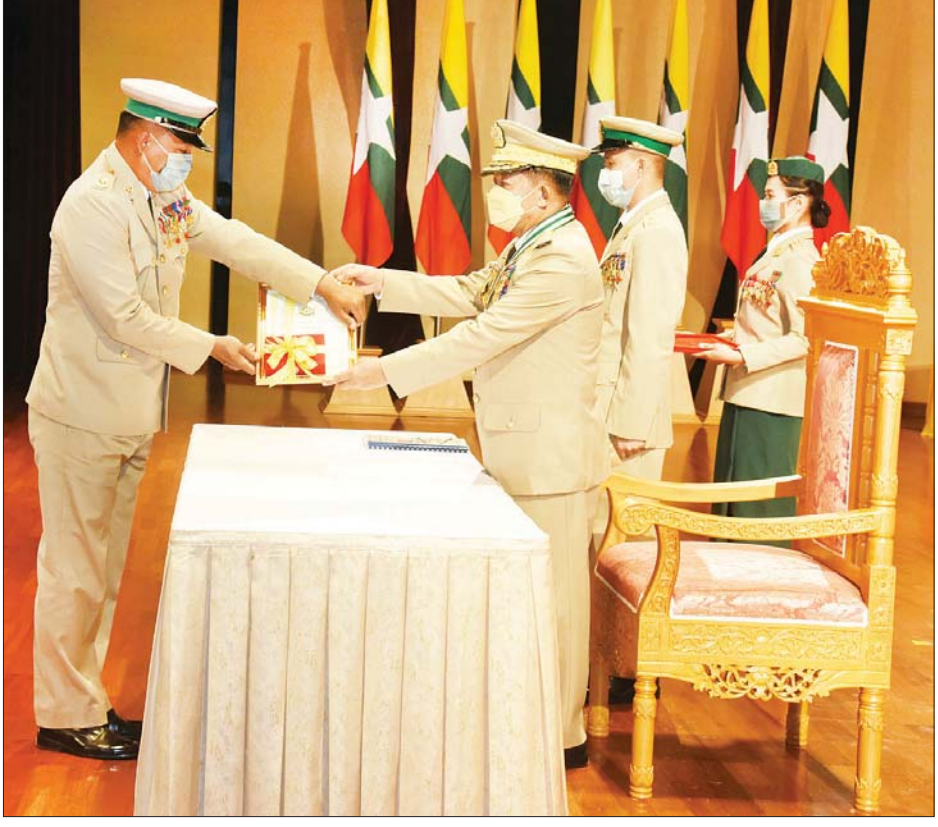
နိုင်ငံတော်စီမံအုပ်ချုပ်ရေးကောင်စီဥက္ကဋ္ဌ၊ တပ်မတော်ကာကွယ်ရေးဦးစီးချုပ် ဗိုလ်ချုပ်မှူးကြီး မဟာသရေစည်သူ မင်းအောင်လှိုင် သူရဲကောင်းမှတ်တမ်းဝင်တံဆိပ်ရရှိသူတစ်ဦးအား ဆုတံဆိပ် ပေးအပ်ချီးမြှင့်စဉ်။

ထိုက်တန်စွာဂုဏ်ပြုချီးမြှင့် ဦးစွာ နိုင်ငံတော်စီမံအုပ်ချုပ်ရေးကောင်စီ ဥက္ကဋ္ဌ၊ တပ်မတော်ကာကွယ်ရေးဦးစီးချုပ်က ဂုဏ်ပြုအမှာစကားပြောကြားရာတွင် လွတ်လပ်ရေးနှင့် အချုပ်အခြာအာဏာ တည်တံ့ခိုင်မြဲရေးအတွက် အဓိကိုင်တော်ကို ကာကွယ်စောင့်ရှောက်ရန်သည် နိုင်ငံသားတိုင်း၏ သမိုင်းပေးတာဝန်ပင်ဖြစ်ကြောင်း၊ ထိုကဲ့သို့ သမိုင်းပေးတာဝန်များကို ရဲစွမ်းပြောင်မြောက်သည့် သူရဲသတ္တိများနှင့် မိမိတို့၏ အသက်ခန္ဓာကို စတေးခံပြီး တိုင်းပြည်ကို အလုပ်အကျွေးပြုခဲ့ကြသည့် နိုင်ငံသားကောင်းများကို ယခုကဲ့သို့ လွတ်လပ်ရေးနေ့ အခါသမယရောက်တိုင်း ထိုက်တန်စွာဂုဏ်ပြုချီးမြှင့်လျက်ရှိခြင်းသည် ဂုဏ်ပြုထိုက်သူကို ဂုဏ်ပြုခြင်းဖြစ်သကဲ့သို့ မျိုးဆက်သစ်လူငယ်များ၊ မျိုးဆက်သစ် တပ်မတော်သားများအနေဖြင့်လည်း အားကျအတုယူစေရန်ပင် ဖြစ်ကြောင်း။ မော်ကွန်းထိုးထားခဲ့ဖြစ် တိုင်းပြည်တစ်ခုအတွက် ကိုယ်ပိုင်လွတ်လပ်ရေးနှင့် အချုပ်အခြာအာဏာဆိုသည်မှာ အလွန်အရေးကြီးသည့်အရာများပင်ဖြစ်ကြောင်း၊ တိုင်းပြည်လွတ်လပ်ရေးအတွက် တိုက်ပွဲဝင်ရင်း အသက်ပေးခဲ့ကြသူများအတွင်း၌ မျိုးချစ်တိုင်းရင်းသားပြည်သူများသာမက ရဟန်းသံဃာများအထိ ပါဝင်ခဲ့သည်ကို အားလုံးသိရှိပြီးဖြစ်ကြောင်း၊ စာမျက်နှာ ၇ သို့