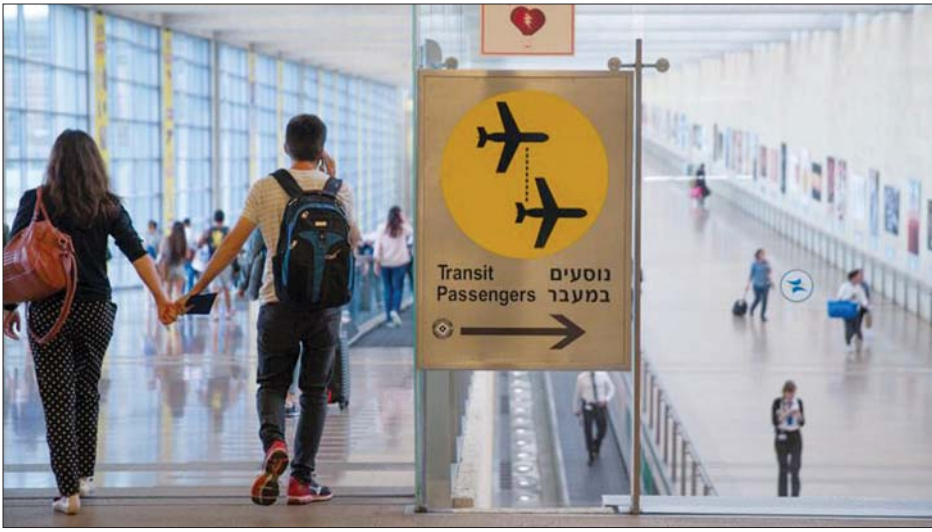
တဲအစစ်မြို့ရှိ ဘင်ဂူရီယန်အပြည်ပြည်ဆိုင်ရာလေဆိပ်ကို တွေ့ရစဉ်။

ဂျေရုဆလင် ဇန်နဝါရီ ၄ အစွဲရောနိုင်ငံသည် ဇန်နဝါရီ ၉ ရက်မှစတင်ကာ နိုင်ငံအများစုမှ နိုင်ငံခြားခရီးသွားများကို အစွဲရော နိုင်ငံအတွင်းသို့ ပြန်လည် ဝင်ရောက်ခွင့်ပြုရန် အစီအစဉ် ရှိသည်ဟု သိရသည်။