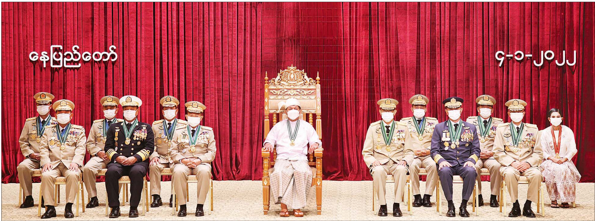
နိုင်ငံတော်စီမံအုပ်ချုပ်ရေးကောင်စီဥက္ကဋ္ဌ၊ နိုင်ငံတော်ဝန်ကြီးချုပ် ဗိုလ်ချုပ်မှူးကြီး မဟာသရေစည်သူ မင်းအောင်လှိုင် သရေစည်သူဘွဲ့၊ စည်သူဘွဲ့၊ သူရဘွဲ့ရရှိသူများ၊ ၎င်းတို့၏ မိသားစုဝင်များနှင့်အတူ စုပေါင်းမှတ်တမ်းတင် ဓာတ်ပုံရိုက်စဉ်။