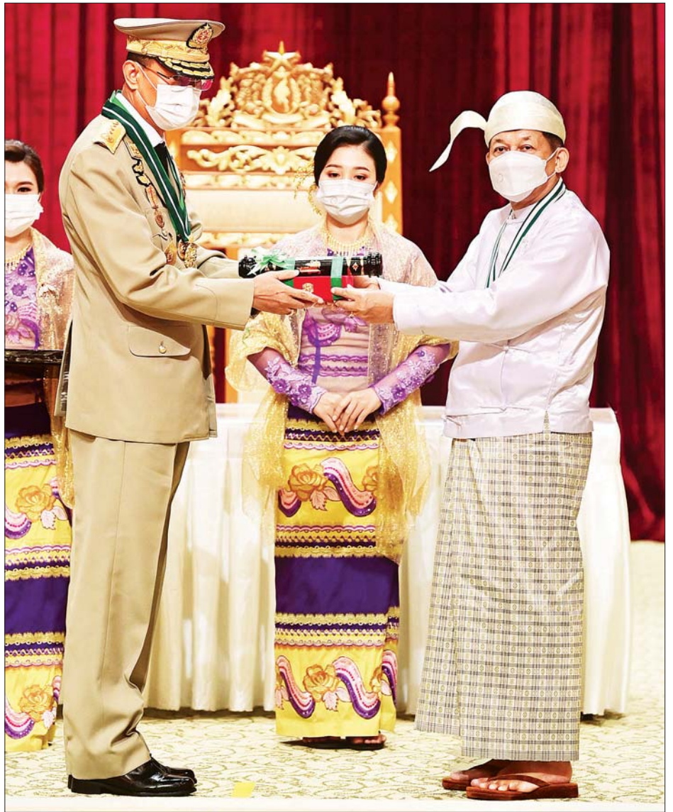
နိုင်ငံတော်စီမံအုပ်ချုပ်ရေးကောင်စီဥက္ကဋ္ဌ၊ နိုင်ငံတော်ဝန်ကြီးချုပ် ဗိုလ်ချုပ်မှူးကြီး မဟာသရေစည်သူ မင်းအောင်လှိုင် သရေစည်သူဘွဲ့ရရှိသူ နိုင်ငံတော်စီမံအုပ်ချုပ်ရေးကောင်စီ ဒုတိယဥက္ကဋ္ဌ၊ ဒုတိယဝန်ကြီးချုပ် ဒုတိယဗိုလ်ချုပ်မှူးကြီး စိုးဝင်း အား ဂုဏ်ထူးဆောင်ဘွဲ့နှင့် တံဆိပ်ပေးအပ်ချီးမြှင့်စဉ်။