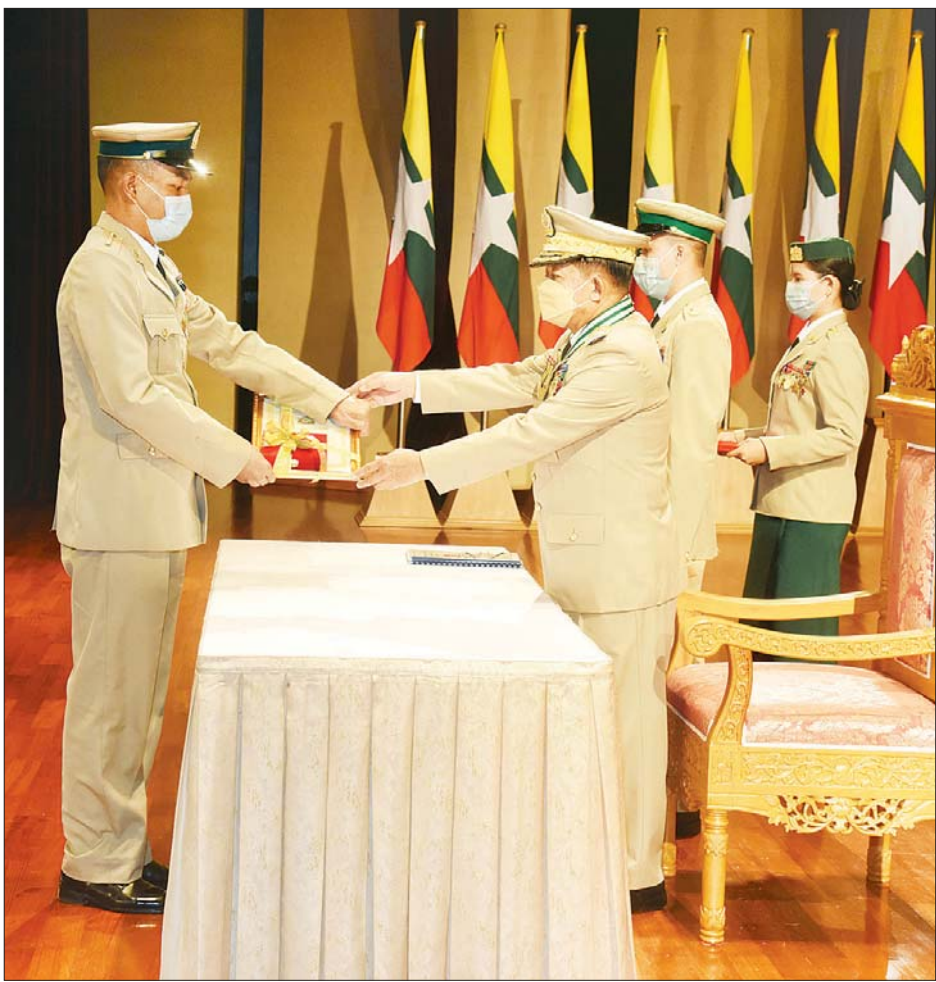
နိုင်ငံတော် စီမံအုပ်ချုပ်ရေးကောင်စီဥက္ကဋ္ဌ၊ တပ်မတော်ကာကွယ်ရေးဦးစီးချုပ် ဗိုလ်ချုပ်မှူးကြီး မဟာသရေစည်သူ မင်းအောင်လှိုင် သူရဲကောင်းမှတ်တမ်းဝင်တံဆိပ်ရရှိသူတစ်ဦးအား ဆုတံဆိပ်ပေးအပ်ချီးမြှင့်စဉ်။

အများသူငါ လုပ်ဆောင်နိုင်ရန် ခဲယဉ်းသည့် တာဝန်များကို စွန့်လွှတ်စွန့်စားမှု အပြည့်ဖြင့် ကျေကျေပွန်ပွန် ထမ်းဆောင်ခဲ့သူများအတွက် တပ်မတော်စွမ်းရည်သတ္တိဆိုင်ရာ ဂုဏ်ထူးဆောင်တံဆိပ်နှင့် လက်မှတ်များ ချီးမြှင့်အပ်နှင်းခြင်း အခမ်းအနားကို မင်္ဂလာတရားတော်နှင့်အညီ နှစ်စဉ် နှစ်တိုင်း လွတ်လပ်ရေးနေ့အခါသမယတွင် ကျင်းပ ပြုလုပ်ပေးလျက်ရှိကြောင်း၊ တိုင်းပြည်နှင့် လူမျိုးအတွက် အခက်အခဲကို အမှုမထားဘဲ အသက်စွန့်လွှတ်မှု၊ ကြံ့ခိုင်သည့်စိတ်ဓာတ်၊ ပြောင်မြောက်သည့် သူရဲသတ္တိများဖြင့် ရဲရင့်ပုံ တိုက်ပွဲဝင်ဆောင်ရွက်မှု၊ စွန့်လွှတ်စွန့်စားသည့်စိတ်ဓာတ်၊ ခိုင်မာသည့် သန္နိဋ္ဌာန်စိတ်ဓာတ်များဖြင့် တာဝန်ထမ်းဆောင်မှု တို့အတွက် အထူးပင်ဂုဏ်ယူမိသကဲ့သို့ ဆုတံဆိပ်များ ချီးမြှင့်ခြင်းမခံရသော်လည်း တက်ညီလက်ညီ စွမ်းဆောင်ခဲ့ကြသူများအားလုံးကို မှတ်တမ်းတင်ဂုဏ်ပြုပါကြောင်းဖြင့် ပြောကြားလိုကြောင်း။