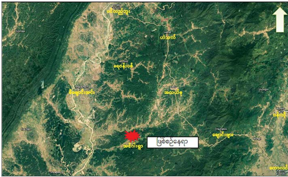
ပင်လည်ဘူးမြို့နယ်အတွင်း အဖျက်အမှောင့်လုပ်ငန်းများဆောင်ရွက်ရန် အင်ဂျင်ကျေးရွာသို့ ရောက်ရှိနေသည့် အကြမ်းဖက်သမားများအား ဝင်ရောက်ဖမ်းဆီးခဲ့သည့်နေရာပြပုံ

များက နယ်မြေလုံခြုံရေးလုပ်ငန်းများ တိုးမြှင့်ဆောင်ရွက်လျက်ရှိကြောင်းနှင့် အကြမ်းဖက်အဖွဲ့များ၏ အေးချမ်းရေးအတွက် ပူးပေါင်းပါဝင်ကြရန် သတင်းဝင်ထွက်သွားလာမှု သတင်းများရရှိပါက သက်ဆိုင်ရာ သတင်းစဉ်