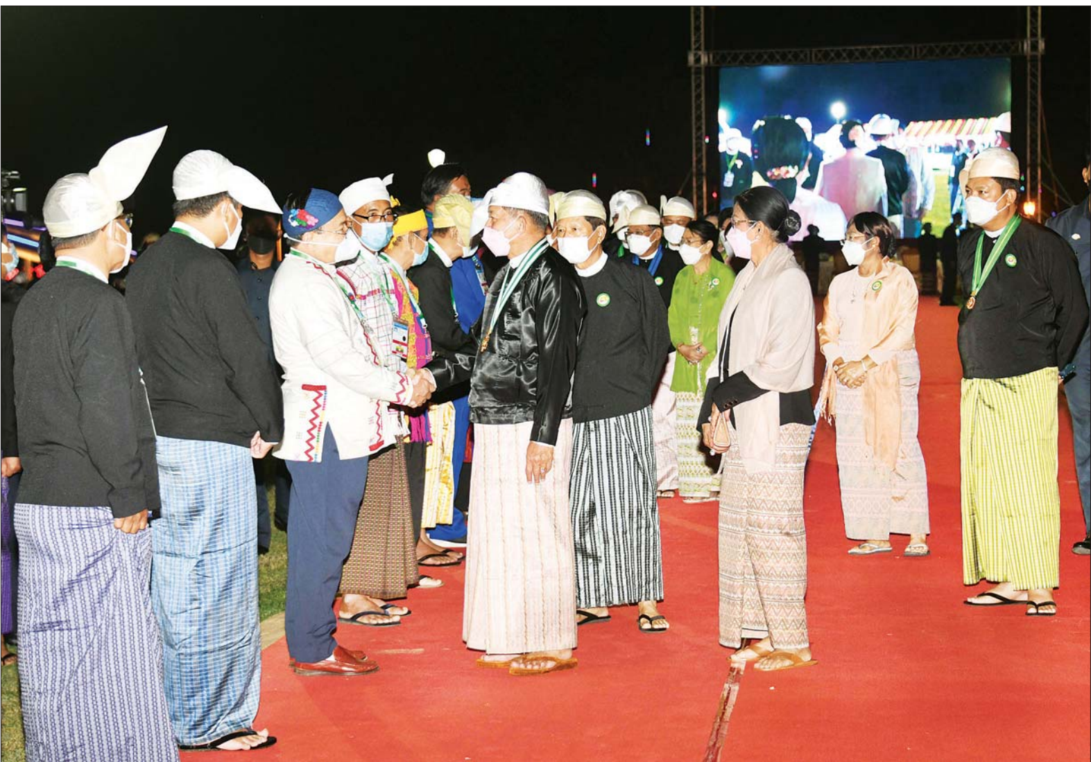
နိုင်ငံတော်စီမံအုပ်ချုပ်ရေးကောင်စီ ဥက္ကဋ္ဌ၊ နိုင်ငံတော်ဝန်ကြီးချုပ် ဗိုလ်ချုပ်မှူးကြီး မင်းအောင်လှိုင်နှင့် ဇနီး ဒေါ်ကြူကြူလှ တို့ (၇၄) နှစ်မြောက် လွတ်လပ်ရေးနေ့ အထိမ်းအမှတ် ဂုဏ်ပြုညစာစားပွဲ အခမ်းအနားသို့ တက်ရောက်လာကြသည့် နိုင်ငံရေးပါတီများမှ ဥက္ကဋ္ဌများနှင့် ကိုယ်စားလှယ်များအား ရင်းရင်းနှီးနှီး လိုက်လံနှုတ်ဆက်စဉ်။

ယင်းနောက် နိုင်ငံတော်စီမံအုပ်ချုပ်ရေးကောင်စီ ဥက္ကဋ္ဌ၊ နိုင်ငံတော်ဝန်ကြီးချုပ် ဗိုလ်ချုပ်မှူးကြီး မင်းအောင်လှိုင်နှင့် ဇနီး ဒေါ်ကြူကြူလှတို့သည် ညစာစားပွဲ အခမ်းအနား ကျင်းပရာ စာမျက်နှာ ၁၀ သို့