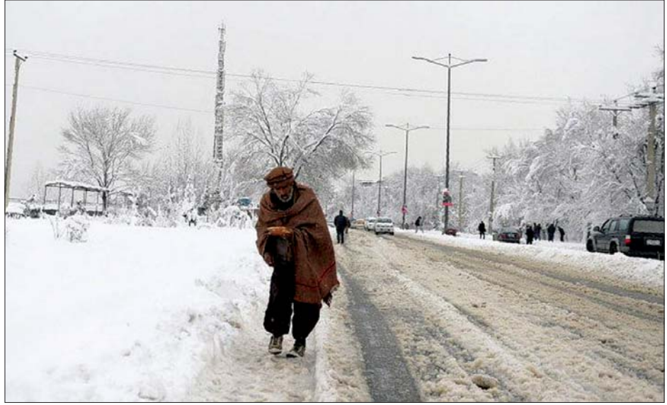
အာဖဂန်နစ္စတန်တွင် ဆီးနှင်းထူထပ်စွာ ကျဆင်းနေသည်ကို တွေ့ရစဉ်။

ရှုပ်ထွေးမှုဖြစ်ပေါ်ခဲ့ပြီး ခုနစ်ဦး လည်းရှိကြောင်း ဒေသခံအာဏာ ထက်မနည်း သေဆုံးခဲ့ကြောင်း ပိုင်များက ဇန်နဝါရီ ၄ ရက်တွင် ပြောသည်။ မြောက်ပိုင်း ဂျေဂျန် ပြည်နယ်တွင် ယာဉ်နှစ်စင်းတိုက် ထိုးပြင် ဒဏ်ရာရရှိသူများ