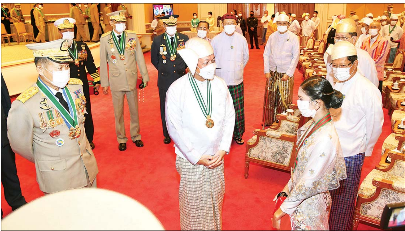
နိုင်ငံတော်စီမံအုပ်ချုပ်ရေးကောင်စီဥက္ကဋ္ဌ၊ နိုင်ငံတော်ဝန်ကြီးချုပ် ဗိုလ်ချုပ်မှူးကြီး မဟာသရေစည်သူ မင်းအောင်လှိုင် သူရဘွဲ့ရရှိသူ ဒုတိယတပ်ကြပ် သက်ရှည်၏ ဇနီးကို ရင်းရင်းနှီးနှီး နှုတ်ဆက်စဉ်။

စာမျက်နှာ ၄ မှ ဒုတိယဥက္ကဋ္ဌ၊ ဒုတိယဝန်ကြီးချုပ် ဒုတိယဗိုလ်ချုပ်မှူးကြီး စိုးဝင်းကိုလည်းကောင်း၊ စည်သူဘွဲ့ရရှိကြသူများကိုယ်စား ကောင်စီဝင် ဗိုလ်ချုပ်ကြီး မြထွန်းဦးကိုလည်းကောင်း၊ တပ်မတော်ဆိုင်ရာ စွမ်းရည်သတ္တိ ဂုဏ်ထူးဆောင်ဘွဲ့ဖြစ်သည့် သူရဘွဲ့ရရှိသူ အမှတ် (၂၀၇)ခြေမြန်တပ်ရင်းမှ ဒုတိယတပ်ကြပ် သက်ရှည်ကိုယ်စား ၎င်း၏ဇနီးကိုလည်းကောင်း၊ စွမ်းဆောင်မှုဆိုင်ရာ ဂုဏ်ထူးဆောင်ဘွဲ့များဖြစ်သည့် ဇေယျကျော်ထင်ဘွဲ့ရရှိကြသူ ၁၇ ဦးကိုယ်စား ဒုတိယဗိုလ်ချုပ်ကြီး ကျော်စွာလင်း ကိုလည်းကောင်း၊ ဝဏ္ဏကျော်ထင်ဘွဲ့ရရှိကြသူ နှစ်ဦးကိုယ်စား ဦးမောင်ကိုကိုလည်းကောင်း ဂုဏ်ထူးဆောင်ဘွဲ့နှင့် တံဆိပ်များ ပေးအပ်ချီးမြှင့်သည်။ ထို့နောက် နိုင်ငံတော်စီမံအုပ်ချုပ်ရေးကောင်စီဥက္ကဋ္ဌ၊ နိုင်ငံတော်ဝန်ကြီးချုပ်သည် ဂုဏ်ထူးဆောင်ဘွဲ့ရရှိသူများ၊ ၎င်းတို့၏ မိသားစုဝင်များနှင့်အတူ မှတ်တမ်းတင် စုပေါင်းဓာတ်ပုံရိုက်ကြသည်။ အခမ်းအနားအပြီးတွင် နိုင်ငံတော်ဝန်ကြီးချုပ်သည် အခမ်းအနားသို့ တက်ရောက်ကြသူများ၊ ဂုဏ်ထူးဆောင်ဘွဲ့ရရှိကြသူများနှင့် ၎င်းတို့၏ မိသားစုဝင်များကို ရင်းရင်းနှီးနှီး နှုတ်ဆက်ခဲ့ကြောင်း သတင်းစဉ်