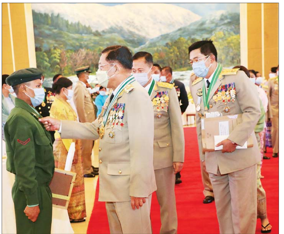
နိုင်ငံတော် စီမံအုပ်ချုပ်ရေးကောင်စီဥက္ကဋ္ဌ၊ တပ်မတော်ကာကွယ်ရေးဦးစီးချုပ် ဗိုလ်ချုပ်မှူးကြီး မဟာသရေစည်သူ မင်းအောင်လှိုင် တပ်မတော်စွမ်းရည်သတ္တိနှင့် စွမ်းဆောင်မှုဆိုင်ရာ ဂုဏ်ထူးဆောင်တံဆိပ်နှင့်လက်မှတ်များ ချီးမြှင့်ခံရသူများကို ရင်းရင်းနှီးနှီး နှုတ်ဆက်စဉ်။

“မျိုးဆက်သစ်များအနေဖြင့် ရှင်မဟာရဋ္ဌသာရ၏ ဂမ္ဘီသာရပျို့လာ “ရဲရေးရောက်သော်၊ ရွံ့ကြောက်မဲ့တွန့်၊ နိုင်ငံဝန်၌၊ ကုမ္မာန်ယက္ခ နာဂခြင်္သေ့၊ ရင်ဆိုင်တွေ့လည်း၊ ခွာ၍မတွန့်၊ အသက်စွန့်လော့” ဟူသည့်စိတ်များဖြင့် အသက်ခန္ဓာနှင့်အပ်ကာ ရည်မှန်းချက်တာဝန်များကို မတွန့်မဆုတ် ကျေပွန်အောင်ထမ်းဆောင်ခဲ့ကြသည့် ရဲဘော်ရဲဘက်များ၏ ယုံကြည်ချက် ခံယူချက်ကောင်းများကို အားကျအတုယူကာ နိုင်ငံတော်က အားကိုးရပြီး ပြည်သူလူထုက လေးစားအားထားရသည့် မျိုးချစ်တပ်မတော်သားကောင်းဇာနည်များဖြစ်အောင် ကြိုးပမ်းဆောင်ရွက်”