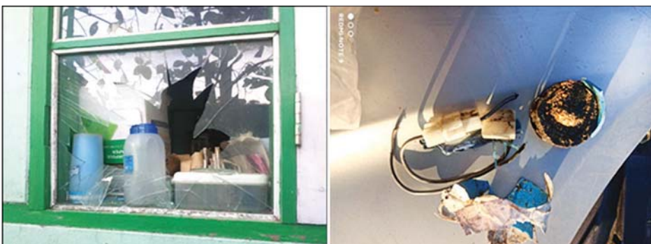
စစ်ကိုင်းတိုင်းဒေသကြီး ရွှေဘိုမြို့နယ်၌ အကြမ်းဖက်အဖွဲ့များက လာရောက်ပစ်ခတ်မှု။

နေပြည်တော် ဇန်နဝါရီ ၄ မြို့နယ်အချို့ရှိ ခရိုင်ပညာရေးမှူးရုံးနှင့် လုံခြုံရေးတပ်ဖွဲ့ဝင်များအား အကြမ်းဖက်သမားများက လက်နက်ကြီး၊ လက်နက်ငယ်များဖြင့် လာရောက်ပစ်ခတ်တိုက်ခိုက်မှုများ ပြုလုပ်ခဲ့ကြောင်း သိရသည်။ ထိုသို့ ပစ်ခတ်တိုက်ခိုက်မှုများ ပြုလုပ်ခဲ့ရာ ဇန်နဝါရီ ၃ ရက်နံနက် ၆ နာရီခန့်တွင် စစ်ကိုင်းတိုင်းဒေသကြီး ရွှေဘိုမြို့နယ်ရှိ ခရိုင်ပညာရေးမှူးရုံးနှင့် အမှတ်(၂) အခြေခံပညာအထက်တန်းကျောင်းဝင်းအတွင်းသို့ အကြမ်းဖက်သမားနှစ်ဦးက ဆိုင်ကယ်ဖြင့် ရောက်ရှိ