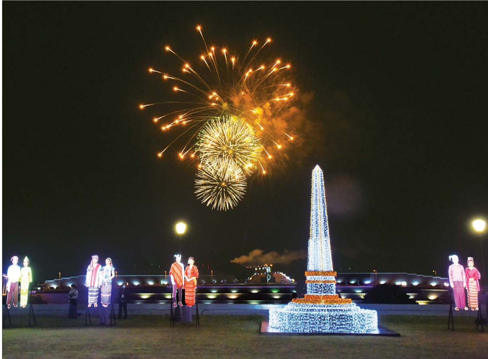
ဂုဏ်ပြုညစာစားပွဲ အခမ်းအနားတွင် (၇၄) နှစ်မြောက် လွတ်လပ်ရေးနေ့ အထိမ်းအမှတ် မီးရှူးမီးပန်းများ ပစ်ဖောက်ဂုဏ်ပြုကြစဉ်။