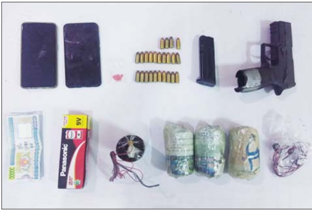
ဒဂုံမြို့သစ် (မြောက်ပိုင်း) မြို့နယ် (၃၃) ရပ်ကွက် ဥဿဖရားလမ်း နေအိမ်မှ သိမ်းဆည်းရမိသည့် လက်နက်/ခဲယမ်းများ။