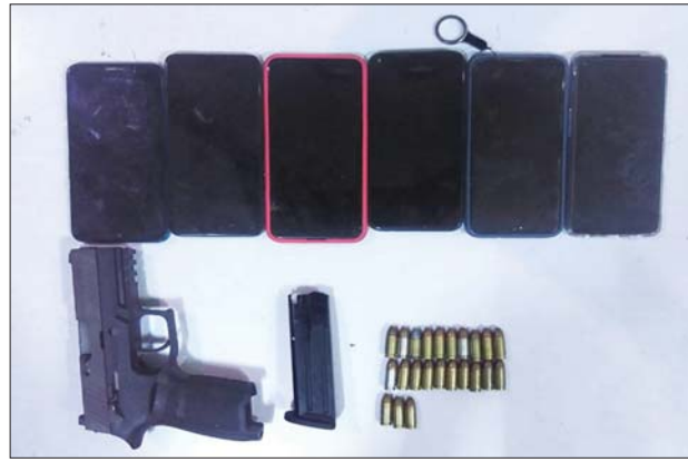
တောင်ဥက္ကလာပမြို့နယ် (၉) ရပ်ကွက် ကျော်သူလမ်း တိုက်အမှတ် ၈၀၃ (၃ လွှာ) မှ သိမ်းဆည်းရမိသည့် လက်နက်/ခဲယမ်းများ။