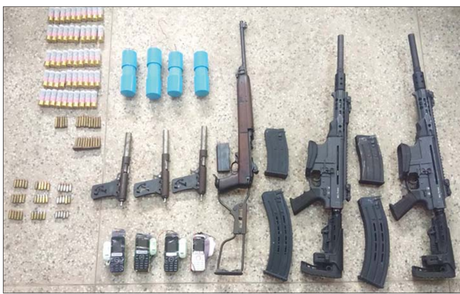
မရမ်းကုန်းမြို့နယ်၊ အလယ်ဗဟိုလမ်း၊ APPOLO Hotel အနီးသိမ်းဆည်းရမိသည့် လက်နက်/ခဲယမ်းများ။