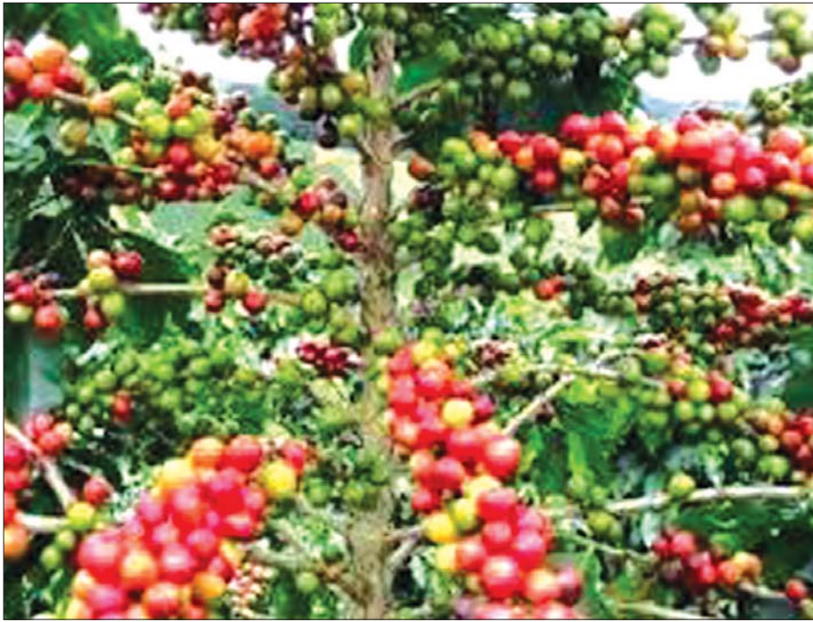
ရွာငံဒေသတွင် စိုက်ပျိုးထားသည့် ကော်ဖီပင်များ။

ကျန်ရှိနေသောကြောင့် ပြည်တွင်းပြည်ပခရီးသွား လုပ်ငန်းများ မြှင့်တင်နိုင်ရေး အပျိုစင်ဒေသအဖြစ် သတ်မှတ်ပေးခဲ့သည်။ အဆိုပါဒေသတွင် ဘရာဇီး မျိုးရင်းဖြစ်သော အာရှဒေသကော်ဖီမျိုးကို စိုက်ပျိုးကြသည်။ ၎င်းဒေသထွက် ကော်ဖီအမျိုး အစားကို အရည်အသွေးမြင့်မားနေစေရန် သဘာဝ တရားက ထောက်ပံ့ပေးလျက်ရှိသည့် သိသာ ထင်ရှားသော ဝိသေသလက္ခဏာများမှာ -