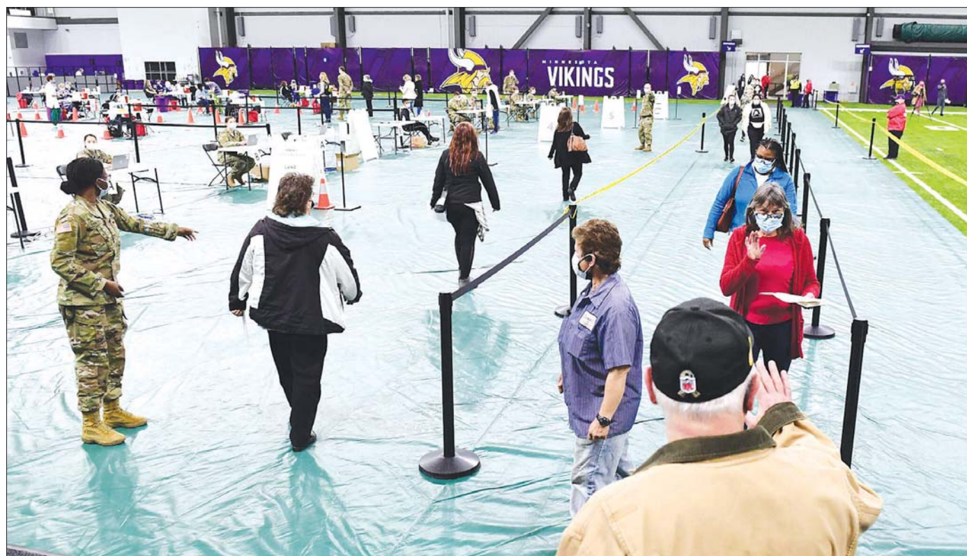
မင်နီဆိုးတားပြည်နယ် အိမ်ဖြူတော်တွင် ကာကွယ်ဆေးထိုးရန် တန်းစီစောင့်ဆိုင်းနေကြသူများကို တွေ့ရစဉ်။

ကူးစက်မှုလျင်မြန်သည့် ဗီဇပြောင်းဒယ်လ်တာဗိုင်းရပ်စ်ကူးစက်မှုများ အမေရိကန်တွင် အနည်းငယ်ငြိမ်သက်သွားပြီးနောက် အချို့သောနေရာများတွင် ကိုဗစ်-၁၉ ကူးစက်မှုများပြန်လည်များပြားလာသည်ဟု အိမ်ဖြူတော် ဆေးဘက်ဆိုင်ရာအကြံပေးအကြီးအကဲဖြစ်သူ အန်သိုနီဖောင်ချီက ပြောသည်။