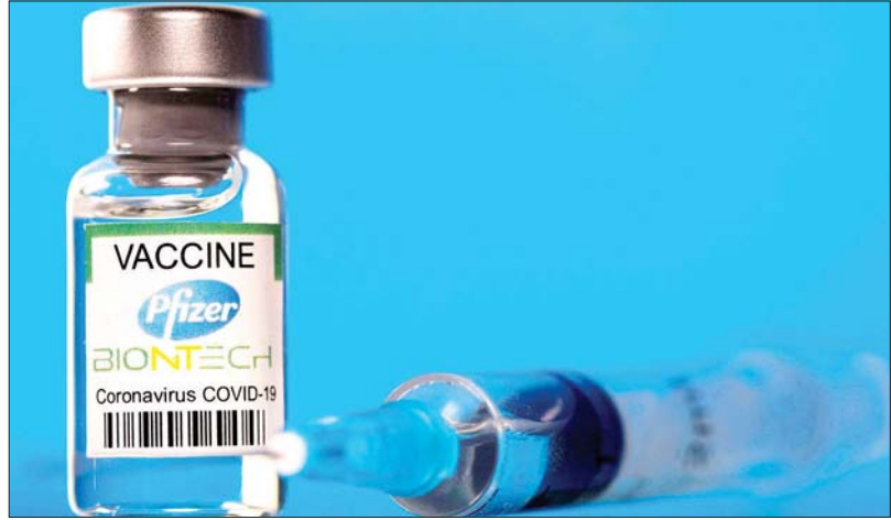
ဖိုဇ်ဇာ-ဘီရွန်တက်ခ် ကိုဗစ်-၁၉ ကာကွယ်ဆေး တစ်မျိုးကို တွေ့ရစဉ်။

လွန်ခဲ့သော သီတင်းပတ်က အမေရိကန်ဆေးဝါးထုတ်လုပ်ရေးကုမ္ပဏီဖြစ်သည့် ဖိုဇ်ဇာက ဘီရွန်တက်ခ်နှင့်ပေါင်းပြီး အသက် ၅ နှစ်မှ ၁၁ နှစ်အကြား ကလေးများအား ကိုဗစ်-၁၉ ကာကွယ်ဆေးထိုးမှုများ ပြုလုပ်ဆောင်ရွက်နိုင်ရန် လျှောက်လွှာတင်သွင်း