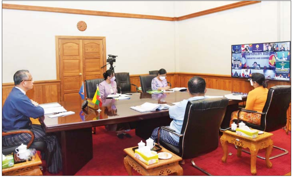
ပြည်ထောင်စုဝန်ကြီး ဦးအောင်နိုင်ဦး ဗီဒီယိုကွန်ဖရင့်ဖြင့် ကျင်းပသည့် (၁၀)ကြိမ်မြောက် အာဆီယံ- ကနေဒါ စီးပွားရေးဝန်ကြီးများအစည်းအဝေးသို့ တက်ရောက်စဉ်။

၂၀၂၀ ပြည့်နှစ်တွင် အာဆီယံ-ကနေဒါ နှစ်နိုင်ငံ ကုန်သွယ်မှုသည် အမေရိကန် ဒေါ်လာ ၁၉ ဒသမ ၉ ဘီလီယံရှိခဲ့ပြီး ကနေဒါမှ အာဆီယံနိုင်ငံများသို့ နိုင်ငံခြားရင်းနှီးမြှုပ်နှံမှု စီးဝင်မှုသည် အမေရိကန် ဒေါ်လာ ၁၂ ဒသမ ၅ ဘီလီယံရှိခဲ့သည်။ ကနေဒါနိုင်ငံမှ အာဆီယံသို့ ရင်းနှီးမြှုပ်နှံမှု စီးဝင်မှုသည် နှစ်စဉ် ၁၁ ဒသမ ၇ ရာခိုင်နှုန်း တိုးတက်လျက်ရှိသည်။ အာဆီယံ-ကနေဒါ လွတ်လပ်သောကုန်သွယ်မှု သဘောတူစာချုပ်ကို ဆောင်ရွက်ခြင်းအားဖြင့် ကနေဒါနိုင်ငံနှင့် အာဆီယံနိုင်ငံများအကြား ကုန်သွယ် မှုနှင့် ရင်းနှီးမြှုပ်နှံမှုများ ပိုမိုတိုးတက်လာမည်ဖြစ်ပြီး မြန်မာနိုင်ငံအနေဖြင့်လည်း အဆိုပါသဘောတူစာချုပ် တွင်ပါဝင်ခြင်းဖြင့် ကနေဒါနိုင်ငံမှ ရင်းနှီးမြှုပ်နှံမှု