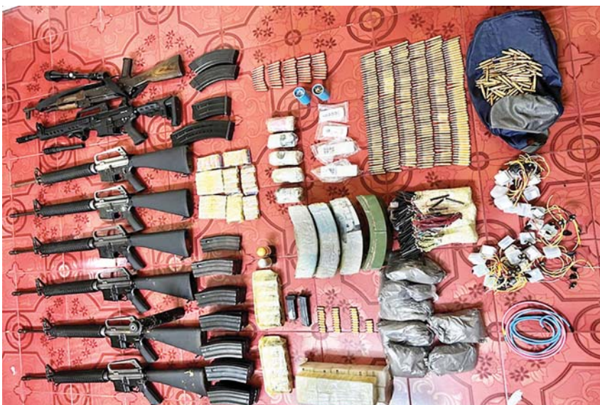
ဗဟန်းမြို့နယ်၊ ယူနိုက်တက်ကွန်ဒိုမှ သိမ်းဆည်းရမိသည့် လက်နက်/ခဲယမ်းများ။