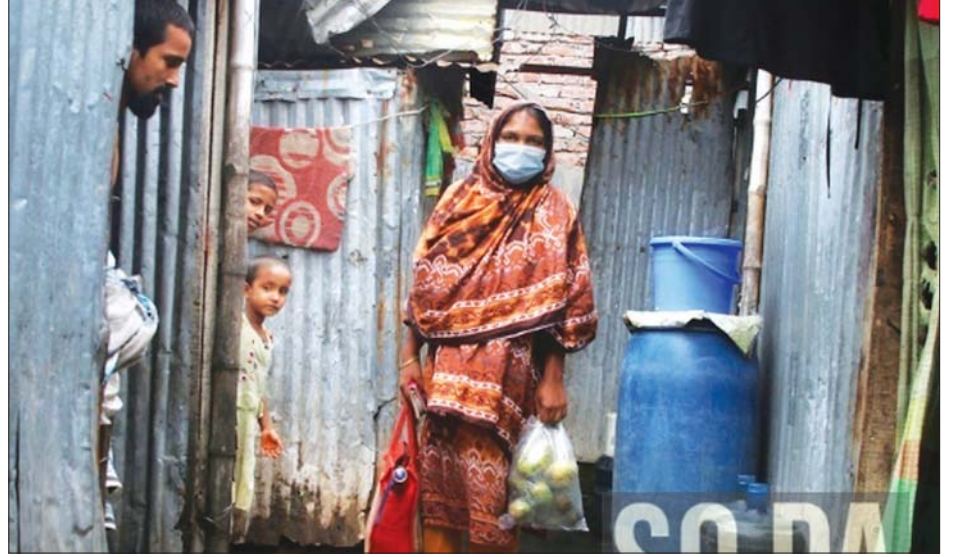
အခြေခံလူတန်းစားများ နေထိုင်သည့် ကိုရေးရပ်ကွက်၌ အမျိုးသမီးတစ်ဦး ပါးစပ်၊ နှာခေါင်းစည်း တပ်ဆင်ထားသည်ကို တွေ့ရစဉ်။

ဇန်နဝါရီလက ဘင်္ဂလားဒေ့ရှ်နိုင်ငံတွင် ကိုဗစ်-၁၉ ကာကွယ်ဆေး ပြန့်နှံ့ထိုးနှံမှုများလုပ်ဆောင်ခဲ့သော်လည်း အိန္ဒိယက တင်ပို့မှုရပ်ဆိုင်းလိုက်သောကြောင့် ဖြေလတွင် ကိုဗစ်-၁၉ ကာကွယ်ဆေးထိုးမှုများ ရပ်ဆိုင်းခဲ့သည်။ တရုတ်နိုင်ငံက လှူဒါန်းထားသည့် ဆီနီဖမ် ကိုဗစ်-၁၉ ကာကွယ်ဆေးထိုးခြင်းဖြင့် ဇွန်လတွင် ကာကွယ်ဆေးထိုးမှုများ ပြန်လည်စတင်ခဲ့သည်။ ဆင်ဟွာ