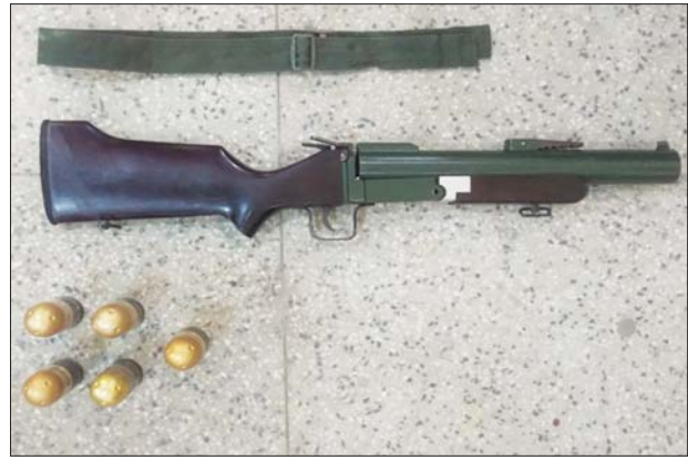
သယ်နန်းကျွန်းမြို့နယ် ဆရာစံလမ်း City Mark အနီး၌ သိမ်းဆည်း ရမိသည့် လက်နက်/ခဲယမ်းများ။

စာမျက်နှာ ၁၀ မှ တစ်ကြိမ်လျှင် ၁၀ နှစ်စီတိုး၍ သက်တမ်း တိုးပေးလေ့ရှိကြသည်။ ကုန်စည်တစ်ခု အား ပြည်ပသို့တင်ပို့ရာတွင် တင်သွင်း နိုင်ငံမှ အသိအမှတ်ပြုသည့် ဈေးကောင်း ရသည့် ကုန်စည်တစ်ခုအနေဖြင့် တင်ပို့ လိုပါက ယင်းနိုင်ငံရှိ ဒေသဆိုင်ရာအညွှန်း မှတ်ပုံတင် ပေးပိုင်ခွင့်ရှိသော ရုံးများတွင် မှတ်ပုံတင်ထားရန် လိုအပ်သည်။ ဒေသဆိုင်ရာအညွှန်းရရှိခြင်း၏အကျိုး ကျေးဇူးများ (က) ဈေးကောင်းရခြင်း အီးယူဈေးကွက်တွင် ဒေသဆိုင်ရာ အညွှန်း ရရှိထားသော ကုန်စည်သည် မရရှိထားသော ကုန်စည်ထက် ၂ ဒသမ ၂၃ ဆ ဈေးပိုရသည်။ အဆ ၂၀ မှ ၅၀ အထိ ဈေးပိုရခဲ့သော