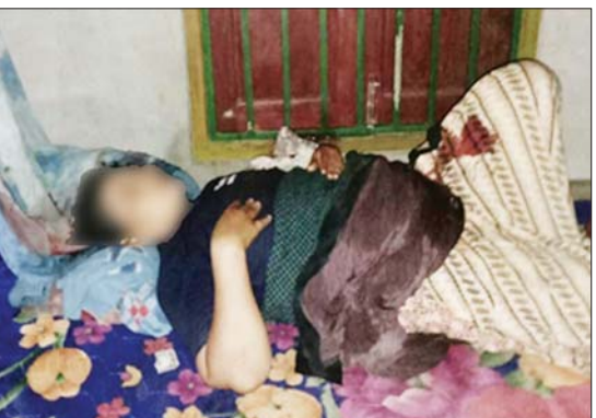
ငါးစွန်မြို့နယ် ဆင်ဖြူကျွန်းကျေးရွာနေ ကျောင်းဆရာ တစ်ဦးနှင့် ဆရာမ တစ်ဦးတို့ကို အကြမ်းဖက် သူများက သေနတ်ဖြင့်ပစ်ခတ်သဖြင့် သေဆုံး၊ ဒဏ်ရာရရှိမှု။