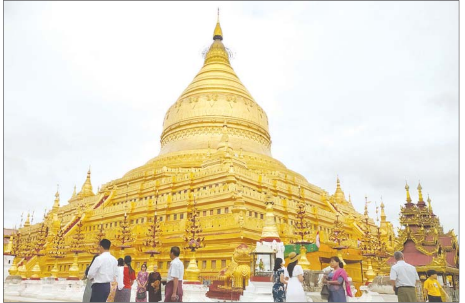
ရွှေစည်းခုံစေတီတော်ကြီးသို့ နိုဝင်ဘာ ၁၇ ရက်က ဘုရားဖူးလာရောက်ကြသော ပြည်သူများ။