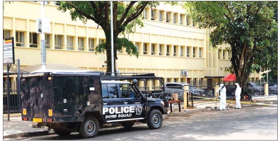
ဗုံးပေါက်ကွဲမှုဖြစ်ပွားသည့်နေရာမှ သက်သေခံပစ္စည်းများ စုစည်းနေသည်ကို တွေ့ရစဉ်။

အသုံးပြုခွင့်ပေးခဲ့သည်။ အက်စ်ထရာဇီကာ ကိုဗစ်-၁၉ ကာကွယ်ဆေးကို အသက် ၁၈ နှစ်နှင့် အထက် အသက်အုပ်စုတွင် အသုံးပြုရန် ကန့်သတ်ထားသည်။ ဆင်ဟွာ