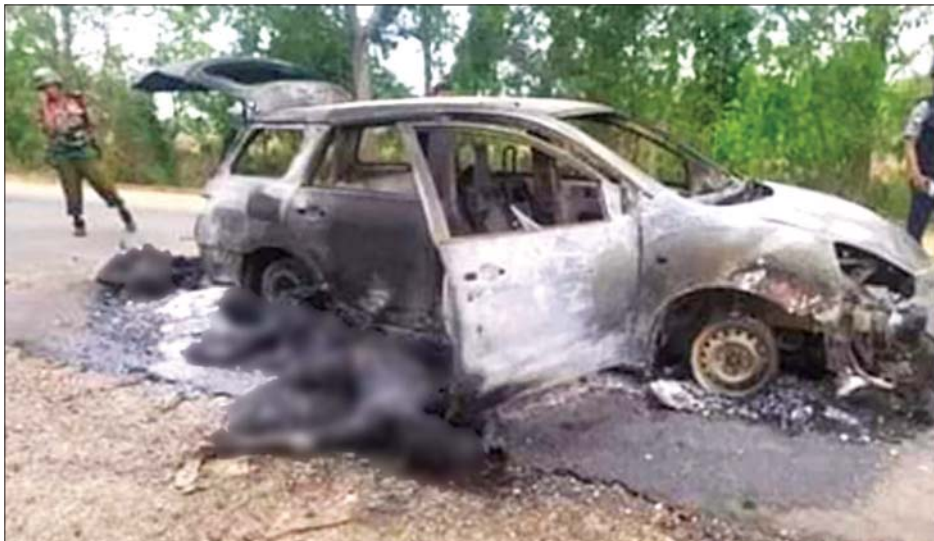
ဂန့်ဂေါမြို့နယ်၌ အကြမ်းဖက်သောင်းကျန်းသူများမှ ပညာရေးဝန်ထမ်းများစီးနင်းလိုက်ပါလာသည့် မော်တော်ယာဉ်တစ်စီးကို တားဆီး၍ သေနတ်ဖြင့် ဝိုင်းဝန်းပစ်ခတ်ပြီး ယာဉ်အား မီးရှို့ဖျက်ဆီးခဲ့သဖြင့် ငါးဦး သေဆုံးကာ တစ်ဦး ဒဏ်ရာရရှိမှု။

၁-၂-၂၀၂၁ ရက်မှ ၁၅-၁၁-၂၀၂၁ ရက်ထိ တိုင်းဒေသကြီး/ ပြည်နယ်အတွင်း ဆူပူအကြမ်းဖက်သောင်းကျန်းသူများကြောင့် ပညာရေးဝန်ထမ်းများ ဒဏ်ရာရရှိခဲ့သည့် ဦးစီးဇယား