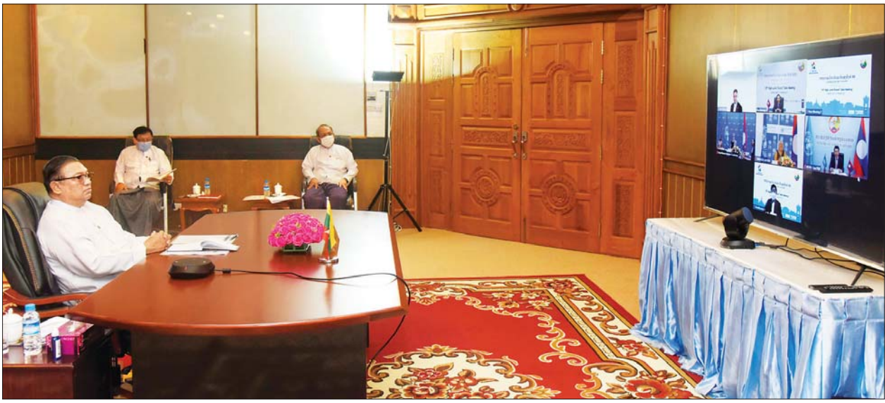
ပြည်ထောင်စုဝန်ကြီး ဦးဝဏ္ဏမောင်လွင် လာအိုပြည်သူ့ဒီမိုကရက်တစ်သမ္မတနိုင်ငံအစိုးရနှင့် ကုလသမဂ္ဂဖွံ့ဖြိုးမှုအစီအစဉ် (UNDP) တို့ ပူးပေါင်း၍ ဗီဒီယိုကွန်ဖရင့်စနစ်ဖြင့် ကျင်းပသည့် (၁၃) ကြိမ်မြောက် အဆင့်မြင့်စကားပိုင်းဆွေးနွေးပွဲ ဖွင့်ပွဲအခမ်းအနားသို့ ပါဝင်တက်ရောက်စဉ်။

အခမ်းအနားသို့ ပြည်ထောင်စုဝန်ကြီးနှင့်အတူ နိုင်ငံခြားရေး