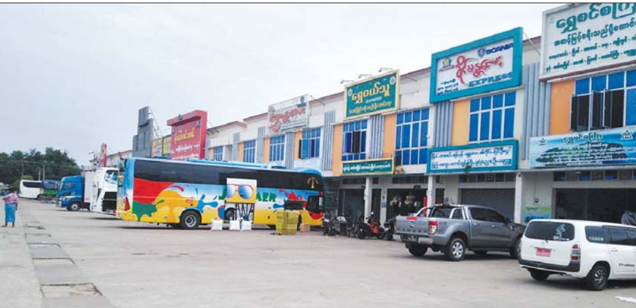
မြိတ်မြို့မှ အဝေးပြေးယာဉ်လိုင်းများ။

မြိတ် နိုဝင်ဘာ ၁၇ တနင်္သာရီတိုင်းဒေသကြီး မြိတ်မြို့တွင် ကိုဗစ်-၁၉ ကူးစက်ရောဂါကြောင့် သုံးလကျော်ရပ်နားထားသည့် မြိတ်- ရန်ကုန် ခရီးသည်တင် အဝေးပြေးယာဉ်လိုင်းများကို နိုဝင်ဘာ ၁၅ ရက်မှ စတင်ကာ ခရီးသည်တစ်ဝက်သာ တင်ဆောင်၍ ကျန်းမာရေးဝန်ကြီးဌာန၏ စည်းကမ်းချက်များနှင့်အညီ ပြန်လည်ပြေးဆွဲခွင့်ပြုလိုက်ပြီဖြစ်ကြောင်း မြိတ်မြို့နယ် ပုဂ္ဂလိကယာဉ်များပြေးဆွဲရေးလုပ်ငန်း ထိန်းသိမ်းကြီးကြပ်ရေးကော်မတီမှ တာဝန်ရှိသူတစ်ဦးက ပြောသည်။ မြန်မာနိုင်ငံတစ်ဝန်း ကိုဗစ်-၁၉ ကူးစက်ရောဂါ ဖြစ်ပွားနေသည့် ကာလတွင် ရောဂါထိန်းချုပ်ကာကွယ်နိုင်ရန်အတွက် တနင်္သာရီတိုင်းဒေသကြီးအတွင်းသို့ တိုင်းကျော်ပြေးဆွဲနေသော ခရီးသည်တင် အဝေးပြေး ယာဉ်လိုင်းများကို တိုင်းဒေသကြီးအစိုးရအဖွဲ့က သုံးလကျော်ကြာ ပြေးဆွဲခွင့် ယာယီပိတ်ထားခြင်းဖြစ်ကြောင်း သိရသည်။ “တိုင်းဒေသကြီးအစိုးရအဖွဲ့က နိုဝင်ဘာ ၁၅ ရက်မှာ ယာဉ်လိုင်းတွေကို ပြန်လည်ပြေးဆွဲဖို့ ညွှန်ကြားလာပါတယ်။ ပြီးရင် မူလစည်းကမ်းချက် ၁၈ ချက်နဲ့အညီ ၅၀ ရာခိုင်နှုန်း (ခရီးသည်တစ်ဝက်နှုန်း)နဲ့ ပြေးဆွဲရမယ်။ ဒီညွှန်ကြားချက်နဲ့အညီ မြိတ်၊ ထားဝယ်၊ မော်လမြိုင်၊ ကော့သောင်း အခြေစိုက် ယာဉ်အသင်းတွေကို လိုက်နာရမယ့် စည်းကမ်းချက်တွေ ထုတ်ပေးလိုက်ပါတယ်။ ရောဂါ ဖြစ်ပွားမှု ကျဆင်းသွားပြီဖြစ်တဲ့အတွက် ဒေသခံနဲ့