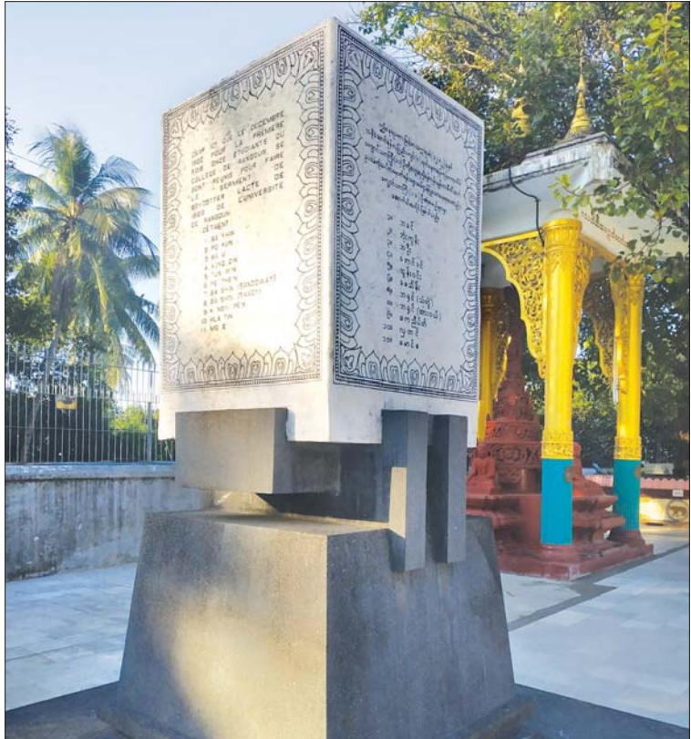
ရွှေတိဂုံဘုရား စနေထောင့်ရှိ ရန်ကုန်ကောလိပ် ကျောင်းသားကြီး ၁၁ ဦး၏ အမည် ရေးထိုးထားသည့် ကမ္ဘာ့ကျောက် တိုင်။

တန်ဆောင်မုန်းလပြည့်ကျော် ၈ ရက်ကို အမျိုးသားနေ့ဟု ထင်ယောင်ထင်မှား ဖြစ်တတ် ကြသည်။ ၈ ရက်နေ့ကား ဖော်ပြပါကျောင်းသားကြီး ၁၁ ဦးတို့က သပိတ်မှောက်ရန် စည်းဝေးဆုံး ဖြတ်သောနေ့ဖြစ်၏။ သပိတ်မှောက်သော နေ့ကား တန်ဆောင်မုန်းလပြည့်ကျော် ၁၀ ရက်နေ့ဖြစ်သဖြင့် ယင်းနေ့ကိုသာ အမျိုးသားနေ့ဟု တွင်သည်။ ထို့ပြင် အမျိုးသားနေ့ ဖြစ်လာစေသော ၁၉၂၀ သပိတ်ကို ၁၉၃၆ ရန်ကုန်တက္ကသိုလ် ကျောင်းသားသပိတ်နှင့် ၁၉၃၈ ကျောင်းသားအရေးတော်ပုံနှင့် ရောထွေး တတ်ကြသေးသည်။ ၁၉၂၀ သပိတ်ကို “၁၉၂၀ ပြည့်နှစ် ရန်ကုန်ယူနီဗာစီတီဘိုင်းကော့” ဟုတွင် သည်။ ထိုခေတ်က သပိတ်မှောက်ခြင်းကို အင်္ဂလိပ် စကား “ဘိုင်းကော့” ဟု မြန်မာတို့ နှုတ်ကျိုးအောင် ခေါ်ခဲ့ကြသည်။ ရန်ကုန်တက္ကသိုလ် အက်ဥပဒေကို ကန့်ကွက်သောအားဖြင့် မှောက်သောသပိတ် ဖြစ်သည်။ ၁၉၃၆ ရန်ကုန်တက္ကသိုလ် ကျောင်းသား သပိတ်ကား အိုးဝေဝေစွာစားစား တည်း ကိုအောင်ဆန်း အား “လွတ်နေသော ငရဲခွေးကြီး” (Hell Hound At Large) ခေါ် အင်္ဂလိပ်စာတိုက်တစ်ပုဒ် ကိစ္စကြောင့် ကျောင်းအုပ်ကြီး မစ္စတာစလော့စ်က ကျောင်းထုတ် ပစ်သော လတ်တလောအကြောင်းမှစ၍ မှောက် သောသပိတ်ဖြစ်သည်။ ၁၉၃၈ ကျောင်းသား အရေးတော်ပုံမှာ ထိုနှစ်ရေခံမြေသပိတ်ကြီး နောက်ဆက်တွဲဖြစ်သည်။ ရေခံမြေသပိတ်တပ်သား များ ရန်ကုန်အထိ ချီတက်လာပြီးအတွင်းဝန်ရုံးများ ကို ဝိုင်း၍ဆန္ဒပြသည်။ တက္ကသိုလ် ကျောင်းသားများ ကလည်း ထောက်ခံသည့်အနေဖြင့် သပိတ်မှောက် ဆန္ဒပြရာ မြင်းစီးပုလိပ်က ရိုက်နှက်နှိမ်နင်းသည်။ ကျောင်းသားကိုအောင်ကျော်သည် အရိုက်ခံရသော ဒဏ်ရာနှင့် ကွယ်လွန်ရာ ကျောင်းသားအရေးတော် ပုံကြီး ပေါက်ကွဲလေသည်။ ယင်းသပိတ်မှောက်