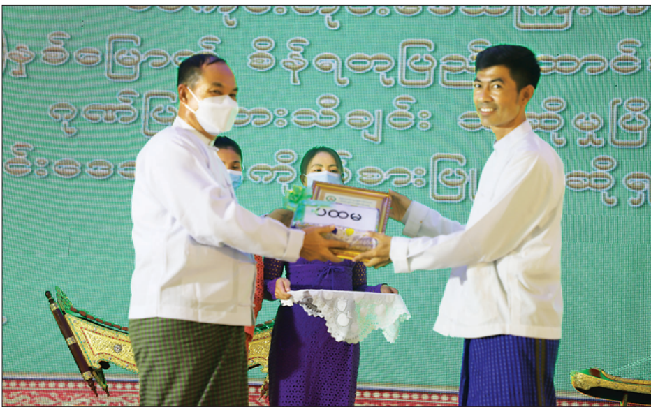
ပွဲအတွက် တိုင်းဒေသကြီး ရှင်များ သီဆိုယှဉ်ပြိုင်နေမှုကို အနားကို ကျင်းပရာ တိုင်းဒေသ ကြည့်ရှုအားပေးသည်။ ကြီး သယံဇာတရေးရာ ဝန်ကြီး တိုင်းဒေသကြီးကိုယ်စားပြု အဆို ထို့နောက် ဆုချီးမြှင့်ပွဲအခမ်း ဦးတင်သန်းဝင်းက ဆုရွေးချယ်

ရှေးဦးစွာ တိုင်းဒေသကြီး ဝန်ကြီးချုပ် ဦးမြတ်ကျော်နှင့် တာဝန်ရှိသူများက (၇၅)နှစ် မြောက် စိန်ရတုပြည်ထောင်စုနေ့ ကို ဂုဏ်ပြုသည့် အစီအစဉ်အဖြစ် “တူယှဉ်တွဲပျော် ဂီတပွဲတော်” တေးသီချင်းသီဆိုမှုနှင့် ဖျော်ဖြေ