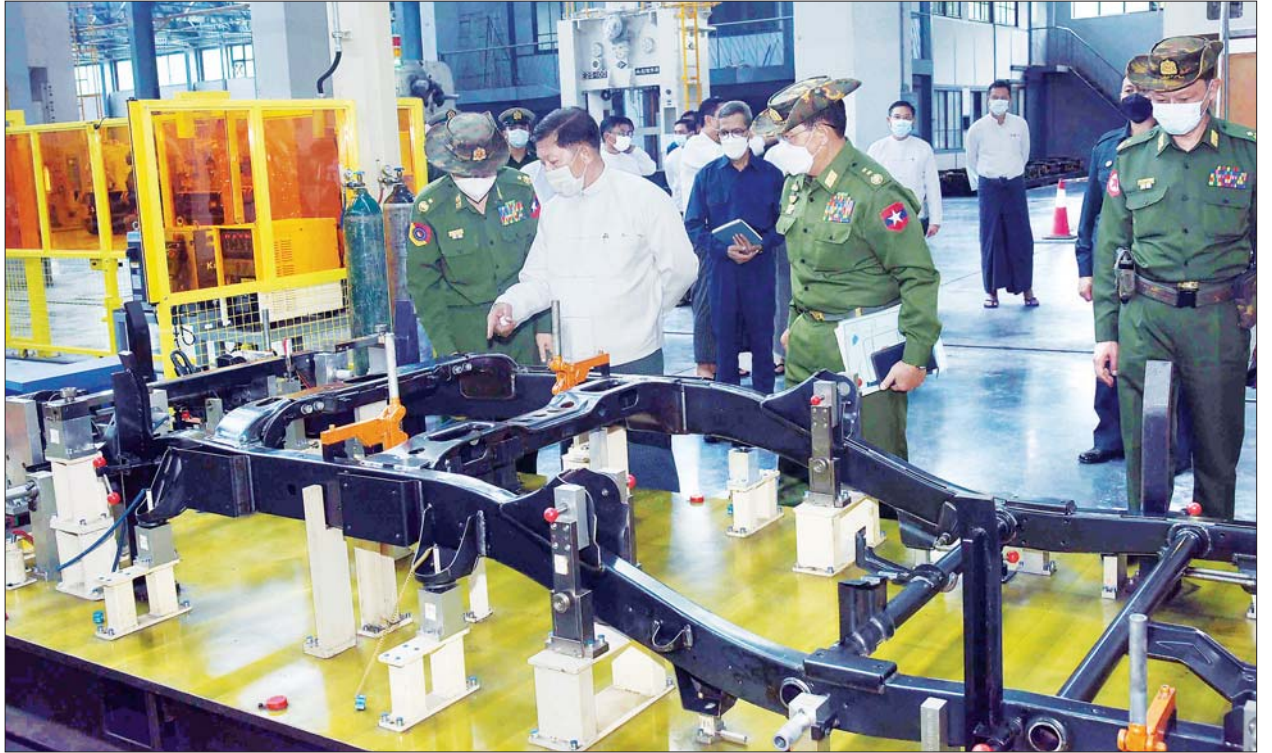
နိုင်ငံတော်စီမံအုပ်ချုပ်ရေးကောင်စီဥက္ကဋ္ဌ၊ နိုင်ငံတော်ဝန်ကြီးချုပ် ဗိုလ်ချုပ်မှူးကြီး မင်းအောင်လှိုင် မရမ်းကုန်းမြို့နယ်ရှိ တပ်မတော်အကြီးစားစက်ရုံ လုပ်ငန်းဆောင်ရွက်နေမှုအား ကြည့်ရှုစစ်ဆေးစဉ်။

ဦးစွာ နိုင်ငံတော်စီမံအုပ်ချုပ်ရေးကောင်စီဥက္ကဋ္ဌ၊ နိုင်ငံတော်ဝန်ကြီးချုပ်နှင့် အဖွဲ့ဝင်များအား ကာကွယ်ရေးဦးစီးချုပ်(ကြည်း) မှ ဒုတိယဗိုလ်ချုပ်ကြီး ကံမြင့်သန်းနှင့် ဗိုလ်ချုပ် ကိုကိုလွင်တို့က စက်ရုံသမိုင်းအကျဉ်း၊ လုပ်ငန်းဆောင်ရွက်နေမှု အခြေအနေများနှင့် နိုင်ငံတော်စီမံအုပ်ချုပ်ရေးကောင်စီဥက္ကဋ္ဌ၊ တပ်မတော်ကာကွယ်ရေး ဦးစီးချုပ်၏ လမ်းညွှန်ချက်နှင့်အညီ မော်တော်ယာဉ်များနှင့် ဆက်စပ်ပစ္စည်းများ ထုတ်လုပ်ခြင်းနှင့် သုတေသနလုပ်ငန်းဆောင်ရွက်နေမှု အခြေအနေများအား သွားရောက်ကြည့်ရှုစစ်ဆေးသည်။