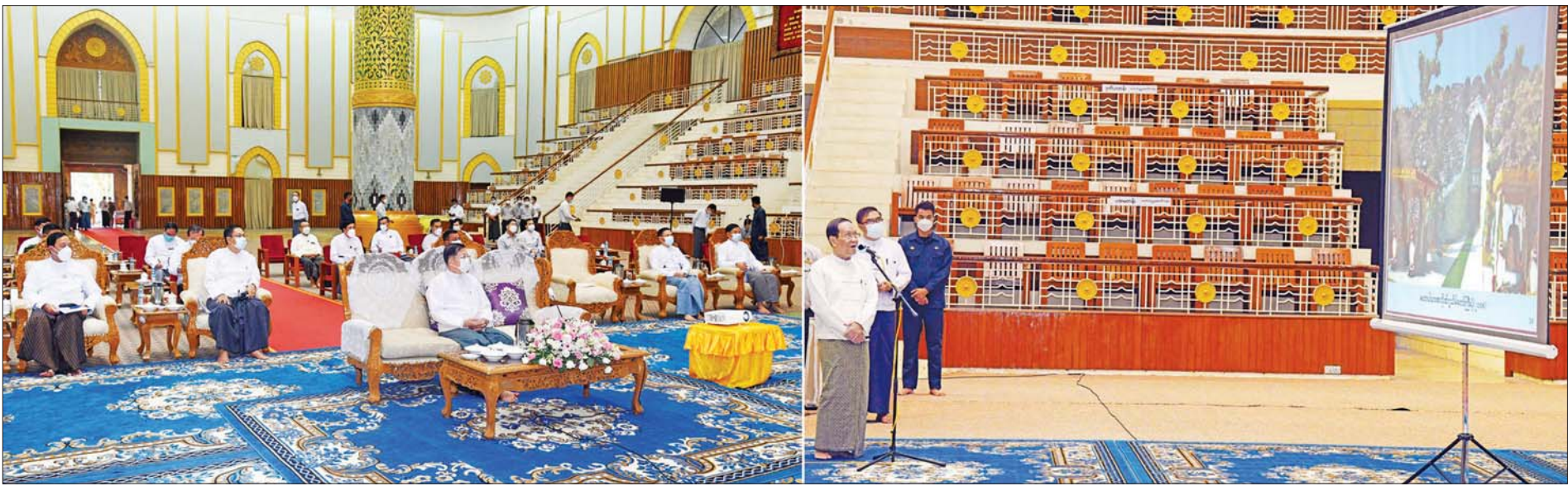
နိုင်ငံတော်စီမံအုပ်ချုပ်ရေးကောင်စီဥက္ကဋ္ဌ၊ နိုင်ငံတော်ဝန်ကြီးချုပ် ဗိုလ်ချုပ်မှူးကြီး မင်းအောင်လှိုင်အား ပြည်ထောင်စုဝန်ကြီး ဦးကိုကိုက လိုဏ်ဂူတော်ကြီး၏ သမိုင်းအကျဉ်း၊ နှစ်ကာလကြာမြင့်လာပြီဖြစ်သဖြင့် ပျက်စီးယိုယွင်းလာသည့် အခြေအနေများနှင့် ပြုပြင်မွမ်းမံခြင်းလုပ်ငန်းများ ဆောင်ရွက်နိုင်မည့် အခြေအနေများနှင့်ပတ်သက်၍ ရှင်းလင်းတင်ပြစဉ်။

(ပြည်ထောင်စုသမ္မတမြန်မာနိုင်ငံတော်အစိုးရ နိုင်ငံတော်စီမံအုပ်ချုပ်ရေးကောင်စီဥက္ကဋ္ဌ၊ နိုင်ငံတော်ဝန်ကြီးချုပ် ဗိုလ်ချုပ်မှူးကြီး မင်းအောင်လှိုင် ၁၅-၁၀-၂၀၂၁ ရက်နေ့တွင် တစ်နိုင်ငံလုံး ပစ်ခတ်တိုက်ခိုက်မှု ရပ်စဲရေး သဘောတူစာချုပ် (NCA) ချုပ်ဆိုခြင်း (၆) နှစ်မြောက် နှစ်ပတ်လည်နေ့သို့ ပေးပို့သည့် သဝဏ်လွှာမှ ကောက်နုတ်ချက်)