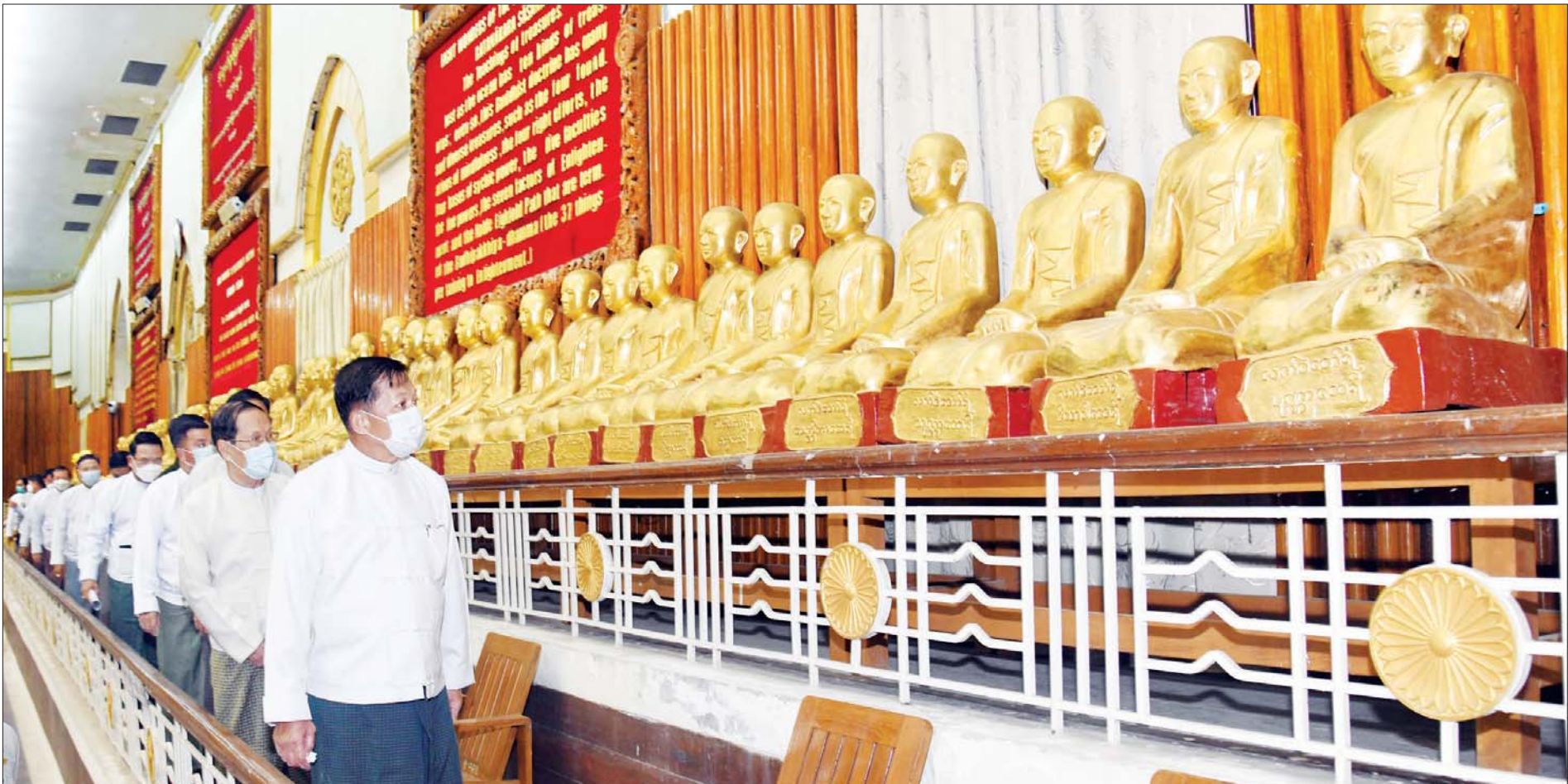
နိုင်ငံတော်စီမံအုပ်ချုပ်ရေးကောင်စီဥက္ကဋ္ဌ၊ နိုင်ငံတော်ဝန်ကြီးချုပ် ဗိုလ်ချုပ်မှူးကြီး မင်းအောင်လှိုင် ရန်ကုန်တိုင်းဒေသကြီး သီရိမင်္ဂလာ ကမ္ဘာအေးကုန်းမြေရှိ ဆဋ္ဌသင်္ဂါယနာတင် မဟာပါသာဏလိုဏ်ဂူသိမ်တော်ကြီး ပြုပြင်မွမ်းမံခြင်းလုပ်ငန်းများ ဆောင်ရွက်နေမှုအခြေအနေများကို ကြည့်ရှုစစ်ဆေးစဉ်။

၅။ အရေးပေါ်ကာလဆိုင်ရာ ပြဋ္ဌာန်းချက်များနှင့်အညီ ဆောင်ရွက်ပြီးစီးပါက ဖွဲ့စည်းပုံအခြေခံဥပဒေ (၂၀၀၈ ခုနှစ်) နှင့်အညီ လွတ်လပ်ပြီး တရားမျှတသော ပါတီစုံဒီမိုကရေစီအထွေထွေရွေးကောက်ပွဲအား ပြန်လည်ကျင်းပ၍ အနိုင်ရသည့်ပါတီအား ဒီမိုကရေစီစံနှုန်းများနှင့်အညီ နိုင်ငံတော်တာဝန်အား လွှဲအပ်နိုင်ရေး ဆက်လက်ဆောင်ရွက်သွားမည်။