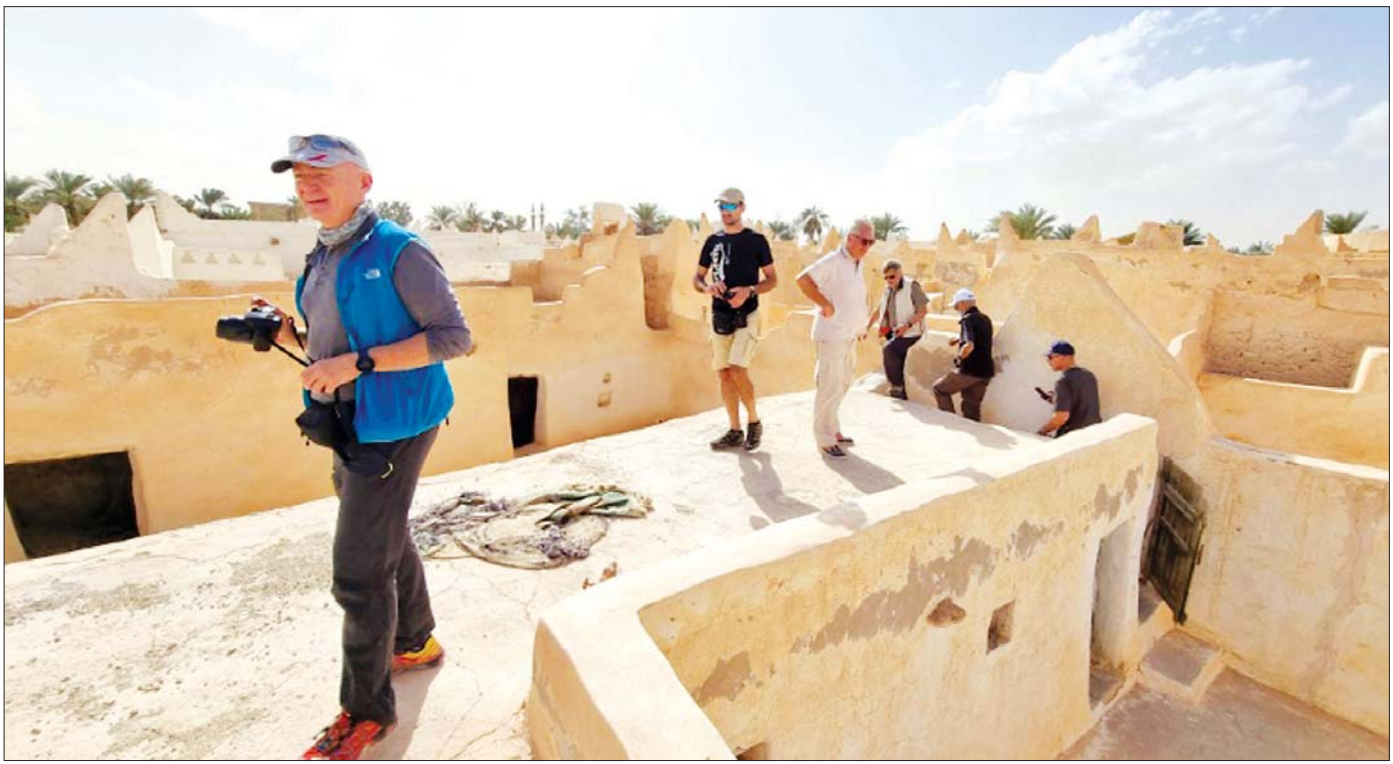
လစ်ဗျားနိုင်ငံအတွင်း လာရောက်လည်ပတ်နေကြသည့် နိုင်ငံခြားခရီးသွားများကို တွေ့ရစဉ်။

လစ်ဗျားနိုင်ငံ၏ အိုအေစစ်မြို့ကလေးဖြစ်သော ဂတ်ဒိမ်းစ်တွင် ရဲတပ်ဖွဲ့ယာဉ်တန်းမှ လုံခြုံရေးသတိပေးသံများလည်း ကြားနေသည်။ စွန့်ပလွံပင်များကြား ဆောက်လုပ်ထားသည့် အဖြူရောင်အဆောက်အအုံဟောင်းများက ခရီးသွားများကို ဆွဲဆောင်လျက်ရှိသည်။ လုံခြုံရေးတင်းကျပ်ထားသည့် ယာဉ်တန်းက ပြင်သစ်၊ အီတလီနှင့်