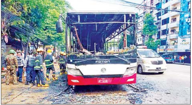
မီးလောင်ပျက်စီးသွားသော YBS ယာဉ်ကို တွေ့ရစဉ်။

ယင်းသို့ အကြမ်းဖက်လုပ်ရပ်လုပ်ဆောင်ခဲ့မှုအပေါ် OMNI FOCUS ကုမ္ပဏီက အကြမ်းဖက်လုပ်ရပ် ကျူးလွန်မှုကို ပြင်းထန်စွာ ရှုတ်ချ ကြောင်းနှင့် ခရီးသွားပြည်သူများ၏ အသက်ဘေးနှင့် လုံခြုံရေးကို အချိန်မီ ကူညီဆောင်ရွက်ပေးခဲ့သည့် ကုမ္ပဏီမှ တာဝန်ခံဝန်ထမ်းများနှင့် လုံခြုံရေးတပ်ဖွဲ့ဝင်များအား မှတ်တမ်းတင်ရက်ပြုကြောင်းကို ဖော်ပြပါအတိုင်း ထုတ်ပြန်ခဲ့သည်ဟု သတင်းရရှိသည်။ သတင်းစဉ်