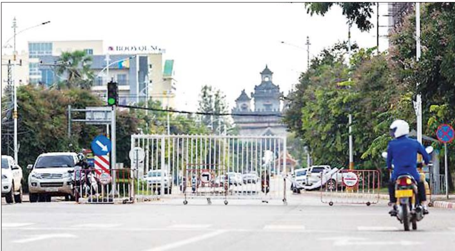
လာအိုနိုင်ငံတွင် အသွားအလာပိတ်ဆို့ကန့်သတ်ထားမှုအား တွေ့ရစဉ်။

ဝန်ကြီးချုပ်ရှုံး ဒုတိယအကြိမ် အကဲ သိဖာခွန် ချန်သာဗွန်စာ က လာအိုနိုင်ငံမြို့တော် ဗီယင် ကျွန်းမြို့တွင် အောက်တိုဘာ ၃၀ ရက်က အသွားအလာပိတ်ဆို့ ကန့်သတ်မှုနှင့် ပတ်သက်၍ သတင်းထောက်များကို ပြောကြား ခဲ့သည်။