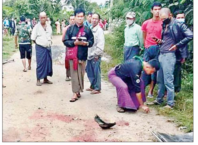
လက်လုပ်မိုင်း ပေါက်ကွဲမှုဖြစ်ပွားသည့်နေရာကို တာဝန်ရှိသူများ စစ်ဆေးစဉ်။