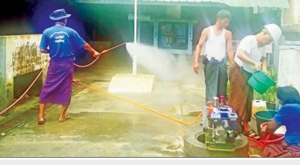
မရမ်းကုန်းမြို့နယ်ရှိ အမှတ်(၂၉) အခြေခံပညာမူလတန်းကျောင်း၌ အောက်တိုဘာ ၃၁ ရက်နံနက်ပိုင်းက မြို့နယ်ပညာရေးမှူး ဦးဆောင် ၍ စုပေါင်းသန့်ရှင်းရေးပြုလုပ်ပြီး ပိုးသတ်ဆေးဖျန်းခြင်းများ ဆောင်ရွက်ကြစဉ်။ မျိုးမင်းသိန်း(မရမ်းကုန်း)

ထိုသို့ ဆောင်ရွက်ပေးလျက်ရှိရာ ယနေ့တွင် ရှမ်းပြည်နယ် (မြောက်ပိုင်း) နမူတူမြို့ တနင်္သာရီတိုင်းဒေသကြီး ရေဖြူမြို့နယ်နှင့် ကော့သောင်း မြို့နယ်၊ စစ်ကိုင်းတိုင်းဒေသကြီး ကနီမြို့နှင့် မန္တလေး တိုင်းဒေသကြီး၊ ကျောက်ပန်းတောင်းမြို့နယ်များအတွင်းရှိ အခြေခံ ပညာကျောင်းများ၏ သန့်ရှင်းသာယာလှပရေးအတွက် သက်ဆိုင်ရာ တိုင်းစစ်ဌာနချုပ်များမှ နယ်မြေခံတပ်မတော်သားများ၊ မြန်မာနိုင်ငံ ရဲတပ်ဖွဲ့ဝင်များနှင့် ဌာန ဆိုင်ရာဝန်ထမ်းများက ကျောင်းဝင်းများအတွင်း၊ အပြင်ရှိ ချုံနွယ် ပေါင်းမြက်များ ခုတ်ထွင် ရင်းလင်းခြင်း၊ အမှိုက်များ ရင်းလင်းခြင်း၊ ရေစီး ရေလာကောင်းမွန်စေရေး ရေနုတ်မြောင်းများ တူးဖော်ပေးခြင်းနှင့် ခြင်ခိုအောင်းနိုင်သော နေရာများ၌ ခြင်ဆေး ဖျန်းခြင်းများကို စုပေါင်းဆောင်ရွက်ပေးခဲ့ကြောင်း သတင်းရရှိ သည်။ သတင်းစဉ်