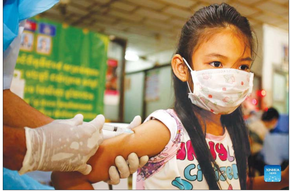
ကမ္ဘောဒီးယားနိုင်ငံတွင် မိန်းကလေးငယ်တစ်ဦးအား ကိုဗစ် -၁၉ ကာကွယ်ဆေးထိုးပေးနေစဉ်။

ဟု ကျန်းမာရေးဝန်ကြီးဌာနက အောက်တိုဘာ ၃၀ ရက်တွင် သတင်းထုတ်ပြန်သည်။ ပြည်နယ်