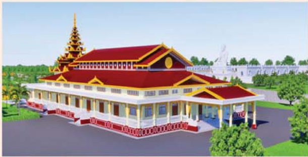
မောရ်(၂၀၃x၉၀)ပေ ၁ လုံး-၈၇၀၀ သိန်း