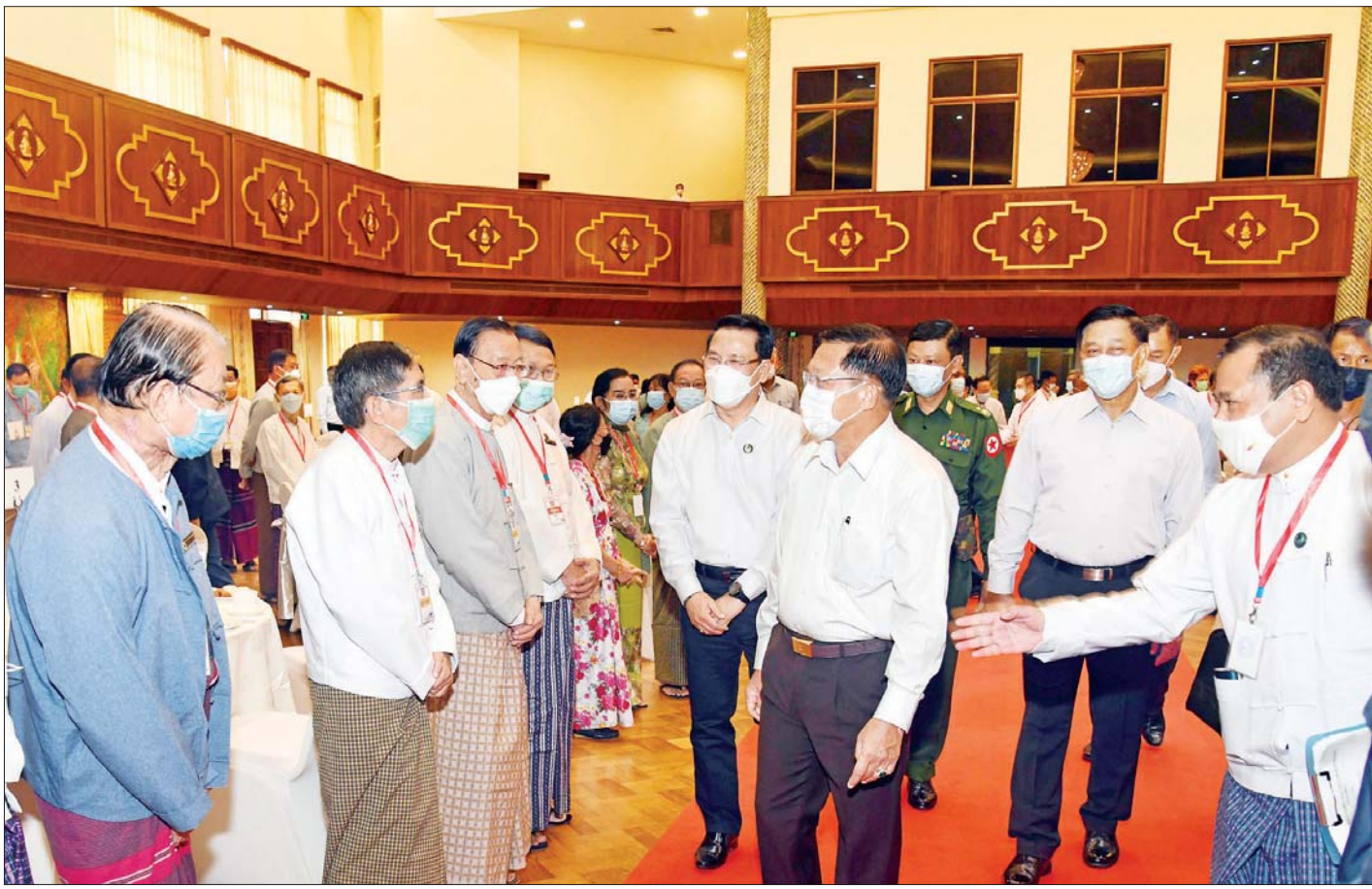
နိုင်ငံတော်စီမံအုပ်ချုပ်ရေးကောင်စီဥက္ကဋ္ဌ၊ နိုင်ငံတော်ဝန်ကြီးချုပ် ဗိုလ်ချုပ်မှူးကြီး မင်းအောင်လှိုင် တက်ရောက်လာကြသည့် စာပေ၊ ရုပ်ရှင်၊ သဘင်၊ ဂီတ ရုပ်ဝန်းအသီးသီးမှ နိုင်ငံကျော်အနုပညာရှင်၊ အတတ်ပညာရှင်များအား ရင်းရင်းနှီးနှီးနှုတ်ဆက်စဉ်။

ဖြစ်ပေါ်ခဲ့သည့် အခြေအနေများတွင် အချို့အနေဖြင့် စိတ်ခံစားမှုနှင့် လှုံ့ဆော်မှုများကြောင့် မှားယွင်းမှုများ ရှိခဲ့သော်လည်း မိမိအနေဖြင့် ခွင့်လွှတ်ပေးပြီး အရေးယူထားသူများအား ပြန်လွှတ်ပေးခဲ့ကြောင်း၊ အနုပညာနှင့်ပတ်သက်၍ ဆောင်ရွက်