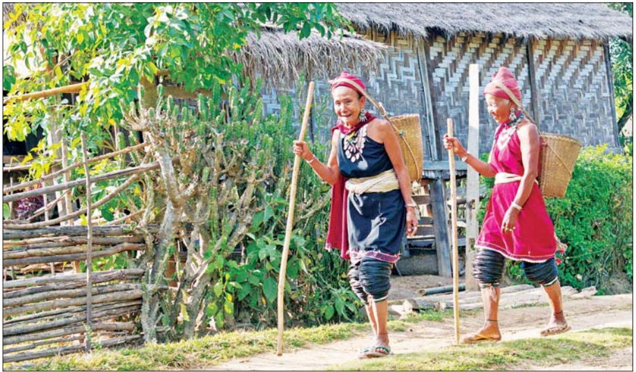
လူထုအခြေပြုခရီးသွားလုပ်ငန်း ဖော်ဆောင်လုပ်ကိုင်သည့် ကယားပြည်နယ် ဒီးမော့ဆိုမြို့နယ် ဒေါတမကြီးကျေးရွာ။

မြောက်မှတောင်သို့ အပြိုင်သွယ်တန်းလျက်ရှိသည်။ မြစ်ချောင်းများသည်လည်း မြောက်မှ တောင်သို့ စီးဆင်းနေခြင်းမှာ စိတ်ဝင်စားဖွယ် ကောင်းသည်။ ချင်းပြည်နယ်သည် သဘာဝအခြေခံခရီးသွားများ ကြိုက်နှစ်သက်သည့် ဒေသတစ်ခုဖြစ်ပြီး အထူး သဖြင့် ပြည်ပမှ ရုက္ခဗေဒပညာရှင်များ အများအပြား လာရောက်သော ဒေသတစ်ခုဖြစ်သည်။ ချင်း ပြည်နယ်သို့လာရောက်ပါက ပထမ ကမ္ဘာစစ်မတိုင်မီ နယ်ချဲ့ဗြိတိသျှတို့ကို တွန်းလှန်ခဲ့သော ရှာလ်လမ်း ခံတပ်(Shallum Fort)၊ ပင်လယ်ရေပြင်အမြင့်ပေ