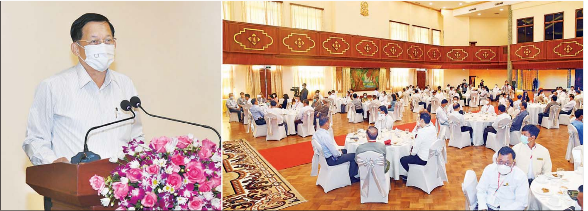
နိုင်ငံတော်စီမံအုပ်ချုပ်ရေးကောင်စီဥက္ကဋ္ဌ၊ နိုင်ငံတော်ဝန်ကြီးချုပ် ဗိုလ်ချုပ်မှူးကြီး မင်းအောင်လှိုင် စာပေ၊ ရုပ်ရှင်၊ သဘင်၊ ဂီတကဏ္ဍအသီးသီးမှ အနုပညာရှင်များအား တွေ့ဆုံအမှာစကားပြောကြားစဉ်။