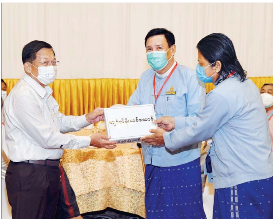
နိုင်ငံတော်စီမံအုပ်ချုပ်ရေးကောင်စီဥက္ကဋ္ဌ၊ နိုင်ငံတော်ဝန်ကြီးချုပ် ဗိုလ်ချုပ်မှူးကြီး မင်းအောင်လှိုင် မြန်မာနိုင်ငံ သဘင်ပညာရှင်များကိုယ်စား မြန်မာနိုင်ငံသဘင်အစည်းအရုံး အမှုဆောင် ဦးဌေးလွင်နှင့် တာဝန်ရှိသူတစ်ဦးအား ရန်ပုံငွေကျပ်သိန်းတစ်ထောင် ပေးအပ်စဉ်။

ဦးစွာ နိုင်ငံတော်စီမံအုပ်ချုပ်ရေးကောင်စီ ဥက္ကဋ္ဌ၊ နိုင်ငံတော်ဝန်ကြီးချုပ်က နှုတ်ခွန်းဆက်စကားပြောကြားရာတွင် စာပေ၊ ရုပ်ရှင်၊ ဂီတ၊ သဘင် အဖွဲ့အစည်းများသည် သမိုင်းကြောင်းရှိသည့် အဖွဲ့အစည်းများဖြစ်ကြောင်း၊ မိမိတို့သည် အမွေဆက်ခံသည့် သူများဖြစ်ကြောင်း၊ လွတ်လပ်ရေးကြိုးပမ်းမှု