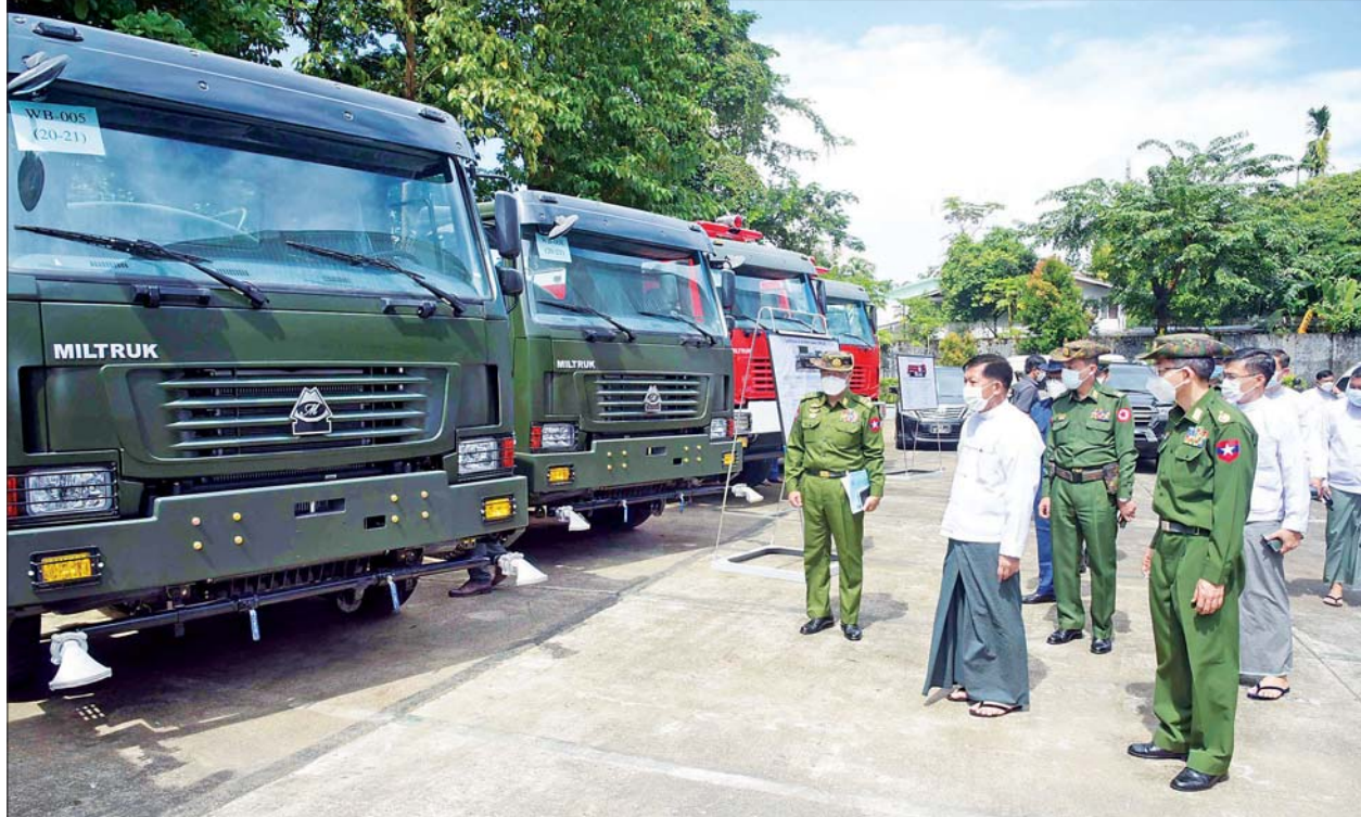
နိုင်ငံတော်စီမံအုပ်ချုပ်ရေးကောင်စီဥက္ကဋ္ဌ၊ နိုင်ငံတော်ဝန်ကြီးချုပ် ဗိုလ်ချုပ်မှူးကြီး မင်းအောင်လှိုင် မရမ်းကုန်းမြို့နယ်ရှိ တပ်မတော်အကြီးစားစက်ရုံမှ ထုတ်လုပ်သည့်မော်တော်ယာဉ်များကို ကြည့်ရှုစစ်ဆေးစဉ်။

များတွင်လည်း အသုံးပြုနိုင်သည့် ပြည့်စုံစွာဖြင့် အရေအတွက် ဖြစ်သည့်အတွက် အရည်အသွေး များများ ထုတ်လုပ်နိုင်ရေး