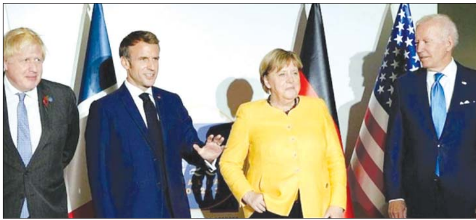
ဗြိတိန်ဝန်ကြီးချုပ် ဘော့ရစ်ဇွန်ဆင်၊ ပြင်သစ်သမ္မတ အီမန်နျူရယ်မက်ခရစ်၊ ဂျာမနီဝန်ကြီးချုပ်အင်ဂျလာ မာကာယနှင့် အမေရိကန်သမ္မတ ဂျိုးဘိုင်ဒင်တို့ကို တွေ့ရစဉ်။