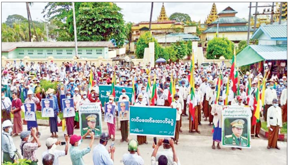
ဧရာဝတီတိုင်းဒေသကြီးအတွင်းရှိ ပြည်သူများက နိုင်ငံတော်စီမံအုပ်ချုပ်ရေးကောင်စီနှင့် မြန်မာ တပ်မတော်အား ထောက်ခံဆန္ဒဖော်ထုတ်ကြစဉ်။

နေပြည်တော်အောက်တိုဘာ ၃၁ ၂၀၂၀ ခုနှစ် ဖွဲ့စည်းပုံအခြေခံ ဥပဒေနှင့်အညီ ဆောင်ရွက်လျက် ရှိသည့် နိုင်ငံတော်စီမံအုပ်ချုပ်ရေး ကောင်စီအား ထောက်ခံပွဲကို ယနေ့တွင် ရန်ကုန်တိုင်းဒေသ ကြီး အင်းစိန်မြို့နယ်၊ ဧရာဝတီ တိုင်းဒေသကြီး ကျိုက်လတ်မြို့ နှင့် ငပုတောမြို့၊ မန္တလေးတိုင်း ဒေသကြီး ချမ်းမြသာစည်မြို့နယ် နှင့် ပဲခူးတိုင်းဒေသကြီး သာယာဝတီမြို့တို့၌ ပြုလုပ်ကြ ပြီး ဆန္ဒဖော်ထုတ်ခဲ့ကြသည်။