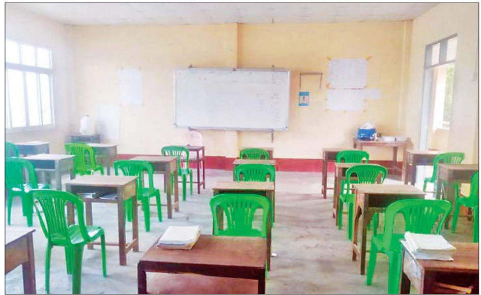
ကန်ကြီးထောင့်မြို့နယ်ရှိ အခြေခံပညာကျောင်းများပြန်လည်ဖွင့်လှစ်ရာတွင် အသင့်ဖြစ်ရေးအတွက် စာသင်ခန်းများ ပြင်ဆင်ထားမှုကို တွေ့ရစဉ်။