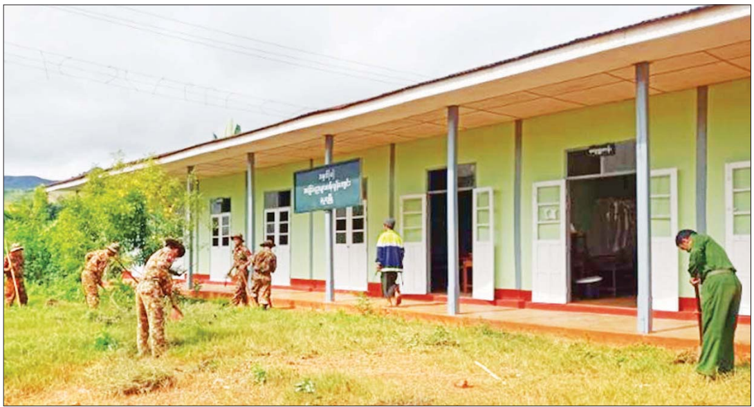
နမ္မတူမြို့ရှိ အခြေခံပညာကျောင်းအတွင်း တပ်မတော်သားများနှင့် ဌာနဆိုင်ရာဝန်ထမ်းများ စုပေါင်းသန့်ရှင်းရေး ဆောင်ရွက်ကြစဉ်။