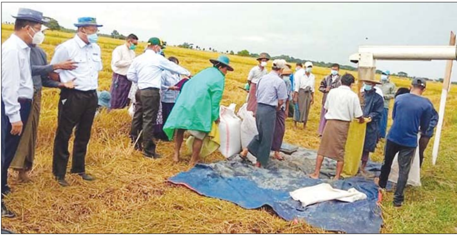
စံကွက်ရိတ်သိမ်းနေမှုကို တိုင်းဒေသကြီးဝန်ကြီးချုပ် ကြည့်ရှုအားပေးနေစဉ်။