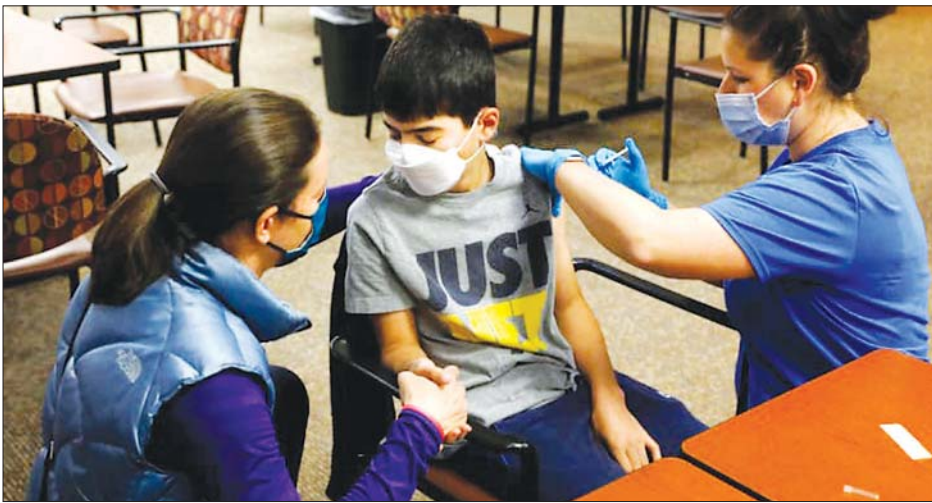
ဖိုချီကန်ပြည်နယ်တွင် ကိုဗစ်-၁၉ ကာကွယ်ဆေးထိုးပေးနေစဉ်။

နယူးယောက် အောက်တိုဘာ ၃၀ အမေရိကန် အစားအသောက်နှင့် ဆေးဝါးကွပ်ကဲရေးဌာန (အက်ဖ် ဒီအေ)သည် ဖိုက်ဇာကုမ္ပဏီ-၁၉ ကာကွယ်ဆေးကို အသက်ငါးနှစ်မှ ၁၁ နှစ်အရွယ်ကလေးများအတွက် အရေးပေါ် အခြေအနေဆိုင်ရာ သုံးစွဲခွင့်ကို ခွင့်ပြုပေးခဲ့သည်ဟု သိရသည်။