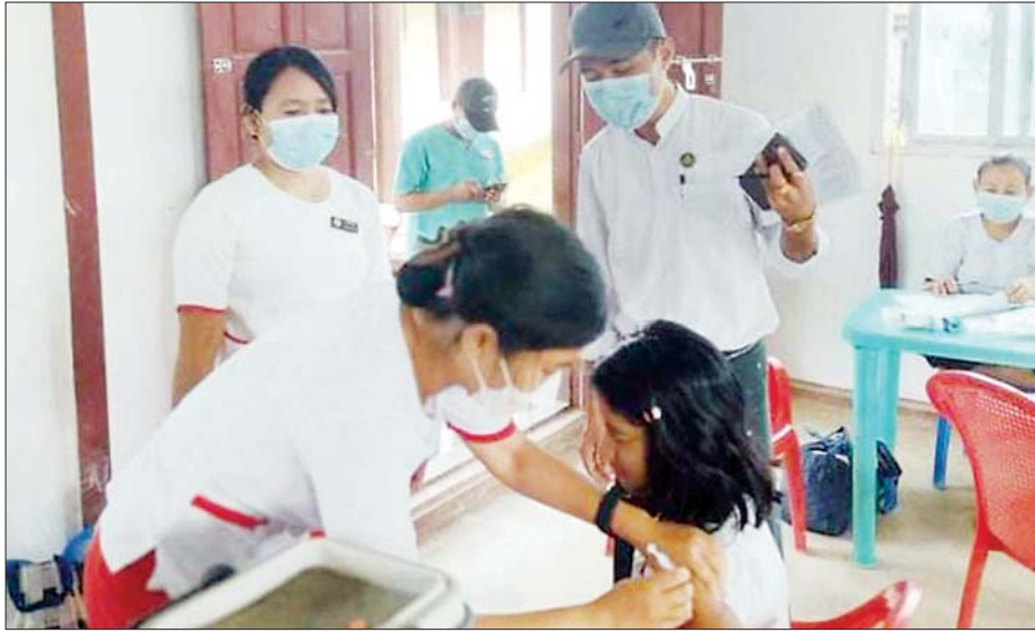
ရေးစစ်ဆေးခြင်းများကို ဆောင် ကာကွယ်ဆေး ထိုးနှံနေမှုတွင် အုပ်ချုပ်ရေးမှူးများနှင့် တာဝန်ရှိ ရွက်ပေးပြီး ပုံမှန်အခြေအနေရှိ ဌာနဆိုင်ရာများ၊ ကျောင်းအုပ် သူများကလည်း ကူညီဆောင်ရွက် ဆရာ ဆရာမကြီးများ၊ ဆရာ ပေးလျက်ရှိကြောင်း သိရသည်။ ဆရာမများ၊ ရပ်ကွက်၊ ကျေးရွာ ခရိုင် (ပြန်/ဆက်)