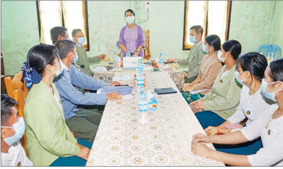
ရုံးလုပ်ငန်းများ ကျွမ်းကျင်အောင် ဆောင်ရွက်ကြရန်နှင့် ရွေးကောက် ပွဲဆိုင်ရာ ဥပဒေ၊ နည်းဥပဒေများ လေ့လာဖတ်ရှုကြရန် တိုက်တွန်း မှာကြားသည်။ ယင်းနောက် ဘူးသီးတောင် မောင်တောမြို့ ကညင်တန်း (မြို့မ)ရပ်ကွက်ရှိ မောင်တော ခရိုင်(ပြန်/ဆက်)

ပြည်ထောင်စု ရွေးကောက်ပွဲ ကော်မရှင်အဖွဲ့ဝင် ဒေါ်နန္ဒာမာရီသည် ရခိုင်ပြည်နယ် ရွေးကောက် ပွဲကော်မရှင်အဖွဲ့ခွဲမှ ပြည်နယ် ရွေးကောက်ပွဲအရာရှိ ဦးသူရိန် ထွဋ်နှင့်အတူ အောက်တိုဘာ ၂၉ ရက်က မောင်တောခရိုင်အတွင်းရှိ ခရိုင်/မြို့နယ် ရွေးကောက်ပွဲ ကော်မရှင် အဖွဲ့ခွဲရုံးများအား ကြည့်ရှုစစ်ဆေးခဲ့ပြီး ဝန်ထမ်း များနှင့် ရင်းရင်းနှီးနှီး တွေ့ဆုံ သည်။