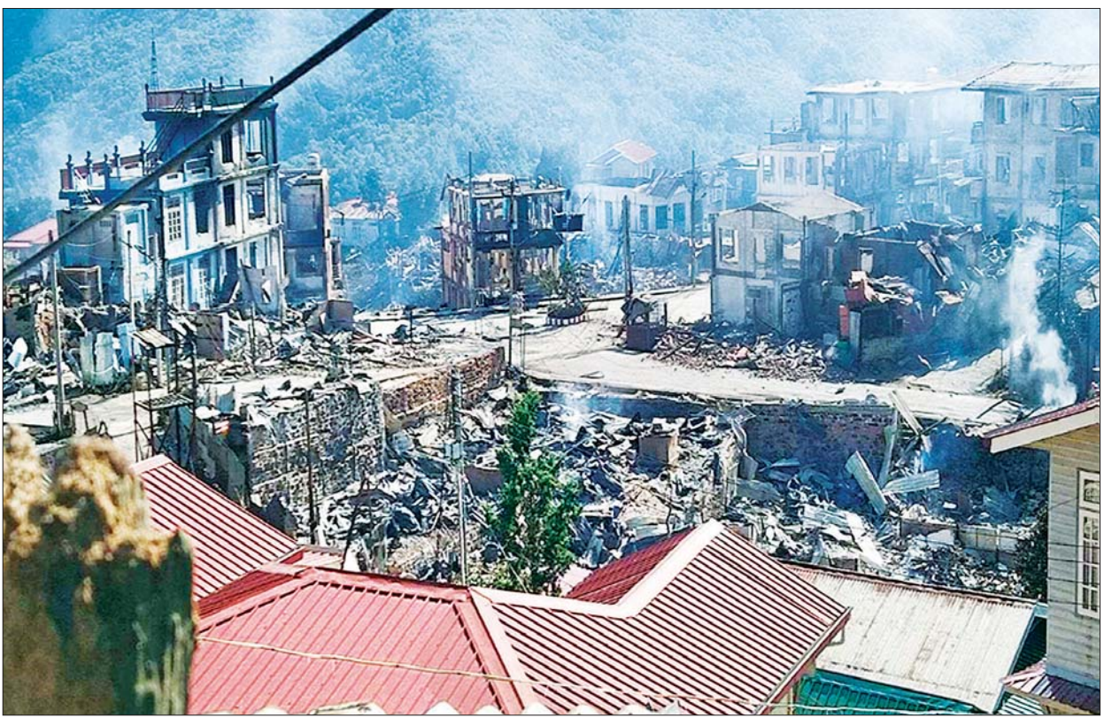
ထန်တလန်မြို့ အမှတ်(၁)ရပ်ကွက်ရှိ နေအိမ်အဆောက်အဦများ မီးလောင်ပျက်စီးမှုကို တွေ့ရစဉ်။