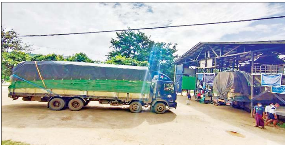
ချင်းရွှေဟော်နယ်စပ်ကုန်သွယ်ရေးစခန်းမှ ကိုဗစ်-၁၉ ရောဂါ ကာကွယ်၊ ထိန်းချုပ်၊ ကုသရေးဆိုင်ရာ ပစ္စည်းများ တင်သွင်းလာစဉ်။

နေပြည်တော် အောက်တိုဘာ ၃၀ Plant ၄၇ ခု၊ ဆေးရုံသုံး စီးပွားရေးနှင့် ကူးသန်းရောင်း ဝယ်ရေး ဝန်ကြီးဌာနအနေဖြင့် ကိုဗစ်-၁၉ ရောဂါ ကာကွယ်၊ ထိန်းချုပ်၊ ကုသရေးဆိုင်ရာ ပစ္စည်းများကို လေကြောင်း၊ ရေကြောင်းနှင့် နယ်စပ်ကုန်သွယ် ရေးစခန်းများမှ နှောင့်နှေး ကြန့်ကြာမှုမရှိ တင်သွင်းနိုင်ရေး အတွက် အချိန်နှင့်တစ်ပြေးညီ စီစဉ်ဆောင်ရွက်ပေးလျက်ရှိရာ ယနေ့တွင် ချင်းရွှေဟော် ကုန်သွယ်ရေးစခန်းမှ တင်သွင်းရာ ကုမ္ပဏီသုံးခုမှ ယာဉ်စီးရေ ငါးစီး ဖြင့် အောက်ဆီဂျင်(အိုးခွဲ) ၁၉၂၀၊ လုပ်ငန်းသုံး အောက်ဆီဂျင်စက် (Oxygen Generator) နှစ်ခုနှင့် နှာခေါင်းစည်း (Mask) ၁၂ တန် တင်သွင်းခဲ့ကြောင်း သိရသည်။ အောက်တိုဘာ ၁ ရက်မှ ၃၀ ရက်အတွင်း ကုမ္ပဏီ ၈၆ ခုမှ ယာဉ်စီးရေ ၁၈၆ စီးဖြင့် အောက် ဆီဂျင်အရည်(Bowser)ယာဉ်ဖြင့် ၃၃၃ တန်၊ အောက်ဆီဂျင်(အရည်) Storage Container နှစ်ခု၊ အောက်ဆီဂျင်(အရည်) Distributor သုံးခု၊ အောက်ဆီဂျင် (အိုးခွဲ) ၁၉၂၇၁ ခု၊ Oxygen