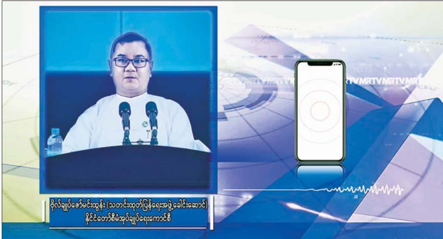
နိုင်ငံတော်စီမံအုပ်ချုပ်ရေးကောင်စီ၊ သတင်းထုတ်ပြန်ရေးအဖွဲ့ ခေါင်းဆောင် ဗိုလ်ချုပ် ဇော်မင်းထွန်း သတင်းမီဒီယာများ၏ ဆက်သွယ်မေးမြန်းမှုကို ဖြေကြားစဉ်။

“ဖြစ်စဉ်မှာ မိမိတို့အဖွဲ့တစ်ယောက် ကျဆုံးခဲ့တာရှိပါတယ်။ အဲဒီအဖွဲ့တွေ လိုက်ရှင်းပြီး ပြန်လာတဲ့အခါမှာ မီးလောင်နေတာ တွေ့လို့ မီးငြိမ်းသတ်ဖို့အတွက် နောက်ထပ်လုံခြုံရေး တပ်ဖွဲ့ဝင်တွေ သွားခဲ့တယ်။ သွားတဲ့အခါမှာလည်း လူနေ အဆောက်အအုံတွေ အကာအကွယ်ယူပြီး မီးငြိမ်းသတ်ဖို့လာတဲ့ လုံခြုံရေးတပ်ဖွဲ့ဝင်တွေနဲ့ သက်ဆိုင်ရာ ဝန်ထမ်းတွေကို ပြန်လည်ပစ်ခတ်ခဲ့ပါတယ်။ ဒါကြောင့် မီးမငြိမ်းသတ်နိုင်ဘဲ မီးလောင်ရခြင်း ဖြစ်ပါတယ်။ တပ်မတော်က ဆောင်ရွက်တာ မဟုတ်ဘူး PDF အကြမ်းဖက်အဖွဲ့တွေက