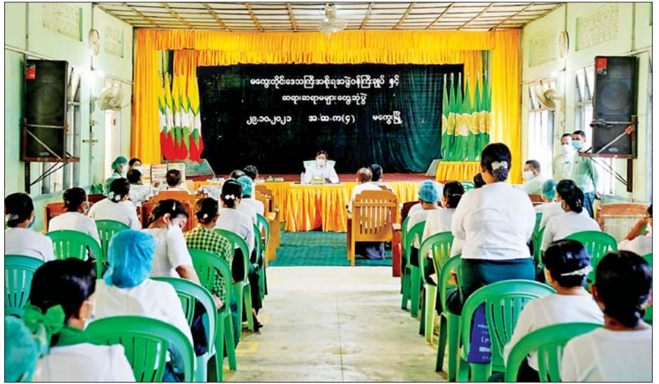
ထိန်းသိမ်းကြရန် လိုအပ်ကြောင်း ပြောကြားသည်။ ပညာရေးမှူးရုံးမှ ဒုတိယညွှန်ကြားရေးမှူးတို့က ယင်းနောက် တိုင်းဒေသကြီး ဝန်ကြီးချုပ်၊ မကွေးမြို့ အ.ထ.က(၄)ကျောင်းရှိ ကျောင်းစာကြည့် တိုင်းဒေသကြီး လူမှုရေးရာဝန်ကြီး၊ တိုင်းဒေသကြီး တိုက်အတွက် စာအုပ်များ ပေးအပ်လှူဒါန်းခဲ့ကြောင်း အစိုးရအဖွဲ့ အတွင်းရေးမှူးနှင့် တိုင်းဒေသကြီး သိရသည်။

ကာကွယ်ရေးအတွက် အသက် ၁၂ နှစ်အထက် ကျောင်းသား ကျောင်းသူအားလုံး ကိုဗစ်-၁၉ ရောဂါ ကာကွယ်ဆေးထိုးနှံကြရန်နှင့် ကိုဗစ်-၁၉ ကာကွယ် ရေးနည်းလမ်းများဖြစ်သည့် နှာခေါင်းစည်းများအား စနစ်တကျ တပ်ဆင်သည့် အလေ့အကျင့်ကောင်းများ ဖြစ်စေရန် တိုက်တွန်း အသိပညာပေးခြင်းများအား ဆောင်ရွက်စေလိုကြောင်း၊ ဆရာ ဆရာမများအနေ ဖြင့် မိမိတို့ကျောင်းသား ကျောင်းသူများ ပညာ သင်ကြားပေးရုံသာမက ယဉ်ကျေးလိမ္မာသော ကျောင်းသား ကျောင်းသူများ ဖြစ်လာစေရန် သင်ကြားပြသပေးစေလိုကြောင်း၊ ကျောင်းရှိ ဆရာ ဆရာမ အများစုသည် မြို့ခံများဖြစ်သည့်အတွက် ကျောင်း၏ အောင်မြင်မှုရလဒ်များကို ဆက်လက်