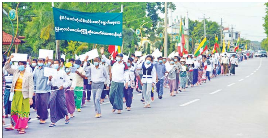
မြစ်ကြီးနားမြို့ရှိ ပြည်သူများက နိုင်ငံတော်စီမံအုပ်ချုပ်ရေးကောင်စီနှင့် မြန်မာ့တပ်မတော်ကို ထောက်ခံ ဆန္ဒဖော်ထုတ်စဉ်။

CRPH၊ PDF အကြမ်းဖက်လုပ်ရပ်များအား ဆန့်ကျင်ကြ၊ ပြည်ထောင်စုမပြိုကွဲရေး ဒို့အရေး၊ တိုင်းရင်းသား စည်းလုံးညီညွတ်မှု မပြိုကွဲရေး ဒို့အရေး၊ အချုပ်အခြာ အာဏာတည်တံ့ခိုင်မြဲရေး ဒို့အရေး၊ ပြည်ပအားကိုး ပုဆိန်ရိုးများအား ဆန့်ကျင်ကြ၊ မြန်မာ့ပြည်တွင်းရေး ပြည်ပစွက်ဖက်မှု အလိုမရှိ၊ နိုင်ငံတော်စီမံအုပ်ချုပ်ရေး ကောင်စီ လုပ်ငန်းစဉ် (၅)ရပ်အား ထောက်ခံပါသည်။ ဒီမို ကရေစီအရေးမြို့ ကွန်မြူနစ်လုပ်ရပ်ကျဆုံးပါစေ၊ NUG၊ PDF အကြမ်းဖက်မှု အမြစ်ဖြတ်၊ NUG၊ PDF အကြမ်းဖက်မှုတွေ မြင်အောင်ကြည့်၊ NUG၊ PDF ရဲ့ ပြည်သူ့အပေါ် အကြမ်းဖက်မှု ချက်ချင်း ရပ်” စသည့်စာသားပါ ဆိုင်းဘုတ်များအား ကိုင်ဆောင် ကြွေးကြော်ခဲ့ကြကြောင်း သတင်းရရှိသည်။ သတင်းစဉ်