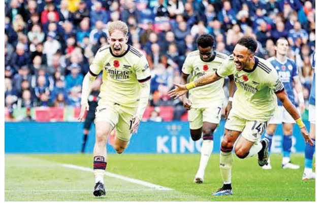
လက်စတာအသင်းဘက်သို့ ဂိုးသွင်းယူပြီးနောက် အာဆင်နယ် ကစားသမားများ အောင်ပွဲခံစဉ်။

ပရီမီယာလိဂ်ပွဲစဉ် (၁၀)၏ အစောဆုံးပွဲစဉ်အဖြစ် လက်စတာ အသင်းနှင့် အာဆင်နယ်အသင်းတို့ ပွဲစဉ်ကို အောက်တိုဘာ ၃၀ ရက် ညပိုင်းက လက်စတာအိမ်ကွင်း၌ ယှဉ်ပြိုင်ကစားခဲ့ရာ အာဆင်နယ် အသင်းက နှစ်ဂိုး-ဂိုးမရှိဖြင့် အနိုင်ရရှိခဲ့သည်။ လက်စတာအသင်းသည် ယနေ့ပွဲစဉ်တွင် ရှုမိုက်ကယ်၊ တိုင်လီ မန်းစါ၊ မက်ဒီဆင်၊ အီဟီယာနာချို၊ ဗာဒီ စသည့် အဓိက ကစား သမားအများစုဖြင့် အာဆင်နယ်အသင်းကို ရင်ဆိုင်လာခဲ့သလို အာဆင်နယ်အသင်းကလည်း ဂါဘရီရယ်၊ လာကာဇက်၊ အူဘာမီယန်တို့ ဦးဆောင်ပြီး အားထားရသည့် ကစားသမားအစုံအလင်ဖြင့် လက်စတာအသင်းကို ရင်ဆိုင်လာခဲ့သည်။