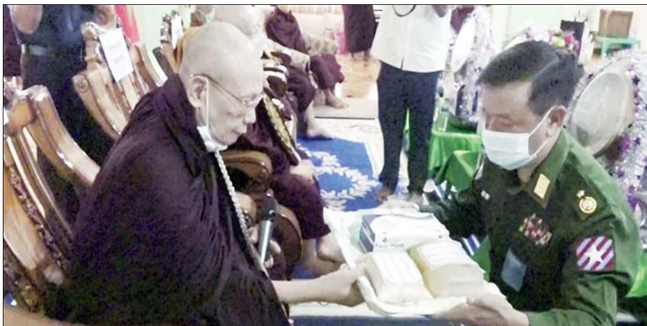
မြောက်တိုင်း စစ်ဌာနချုပ်၊ ခန္တီးတပ်နယ်မှ နယ်မြေခံ ဆွမ်းများ ဆောင်ရွက်ပေးခဲ့ကြောင်း သတင်းရရှိသည်။ ဆေးအဖွဲ့က လိုအပ်သည့် ကျန်းမာရေးစစ်ဆေးပေး သတင်းစဉ်

ပရိယတ္တိစာသင်တိုက်နှင့် စစ်ကိုင်းတိုင်းဒေသကြီး ခန္တီးမြို့ ပေါမိုင်းရပ်ကွက်ရှိ ထေရဝါဒဗုဒ္ဓသာသနာပြု(ဗဟို)ကျောင်းတိုက်တို့မှ ဆရာတော်၊ သံဃာတော်များနှင့် သာသနာ့နွယ်ဝင် သီလရှင်များအတွက် ဆွမ်းဆန် တော်၊ ဆီ၊ ဆား၊ ပဲ အမယ် လေးမျိုး၊ ကိုဗစ်-၁၉ ရောဂါ ကာကွယ်ရေး အထောက်အကူပြုပစ္စည်းများ၊ နေ့ဆွမ်းများ၊ အလှူငွေများနှင့် လှူဖွယ်ပစ္စည်းများကို သက်ဆိုင်ရာ တိုင်းစစ်ဌာနချုပ် အသီးသီးမှ တိုင်းမှူးနှင့် တာဝန်ရှိသူများက သွားရောက်ဆက်ကပ် လှူဒါန်းကြပြီး ဆရာတော်ကြီးများထံမှ ဩဝါဒခံယူကြသည်။ ထို့အပြင် စစ်ကိုင်းတိုင်းဒေသကြီး ခန္တီးမြို့ ပေါမိုင်းရပ်ကွက် ထေရဝါဒ ဗုဒ္ဓသာသနာပြု(ဗဟို) ကျောင်းတိုက်ရှိ သံဃာတော်များအား အနောက်