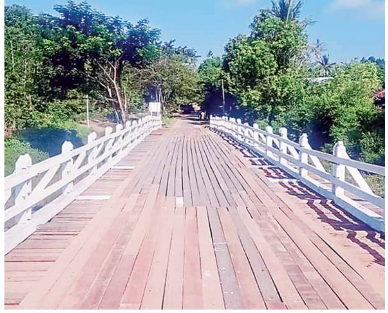
ကသာမြို့ ကျန်တော(ပြည်သာယာ)တံတားကို တွေ့ရစဉ်။