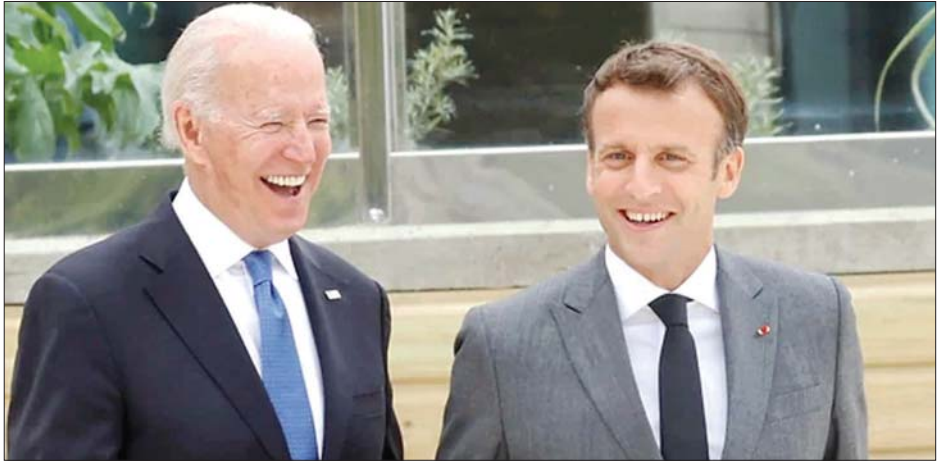
အမေရိကန်သမ္မတဂျိုးဘိုင်ဒင်နှင့် ပြင်သစ်သမ္မတ အီမန်ရှူးရယ်မက်ရွန်။

တွေ့ဆုံမှုအပြီးတွင် နှစ်နိုင်ငံစလုံးက ပူးတွဲ ကြေညာချက်ကို ထုတ်ပြန်ခဲ့သည်။ ကာကွယ်ရေး