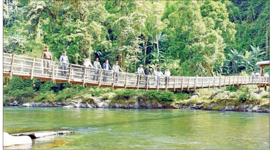
ပြည်နယ်ဝန်ကြီးချုပ် ဦးခက်ထိန်နန်နှင့်အဖွဲ့ မူလာချောင်းကျေးတံတား တည်ဆောက်နိုင်ရေး ကွင်းဆင်း စစ်ဆေးစဉ်။

အဆိုပါ လမ်းပိုင်းသည် လမ်းအရှည် ၂၄ မိုင်ရှိပြီး ရေခဲတောင်နှင့် ဖုန်ကန်ရာဇီရေခဲတောင် ခရီးစဉ် ပူတာအိုဒေသ ခရီးသွားလုပ်ငန်း ဖွံ့ဖြိုးတိုးတက် တစ်ခုအဖြစ် အကောင်အထည်ဖော်ဆောင်ရွက်မှုနှင့် စေရေးအတွက် ဇီယာဒမ်းမှတစ်ဆင့် ဖုန်ရင်ရာဇီ အတူ ကျေးရွာ ရှစ်ရွာအတွင်းရှိ ကျေးလက်နေပြည်သူ