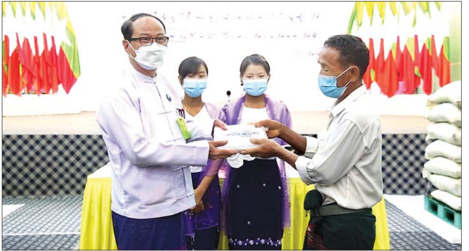
ပေးအပ်သည်။ ကာ လိုအပ်သည်များကို ညှိနှိုင်းဆောင်ရွက်ပေးပြီး မျိုးစေ့သိုလောင်ရုံ၌ ပိုင်းအိုးနီးယားသီးနှံစုံအခြောက်ခံစက် တောင်သူရှင်းလင်းသရုပ်ပြပွဲကိုလည်း တက်ရောက်အားပေးသည်။ စောမျိုးမင်းသိန်း(ပြန်/ဆက်)

ကရင်ပြည်နယ်အတွင်း သဘာဝဘေးဒဏ်ကြောင့် မိုးစပါးသီးနှံ ပျက်စီးဆုံးရှုံးသွားသော တောင်သူများအား စိုက်ပျိုးရေး၊ မွေးမြူရေးနှင့် ဆည်မြောင်းဝန်ကြီးဌာနက ယူရီးယားမြေဩဇာအိတ်များကို အောက်တိုဘာ ၂၈ ရက်က ဘားအံမြို့၊ ဇွဲကပင်ခန်းမ၌ ထောက်ပံ့ပေးအပ်သည်။