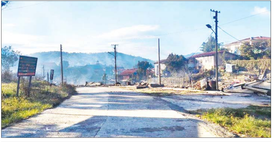
ထန်တလန်မြို့ အမှတ်(၂)ရပ်ကွက်ရှိ ခရစ်ယာန်ဘုရားကျောင်းအဆောက်အအုံ မီးလောင်ပျက်စီးမှုကို တွေ့ရစဉ်။

ဆုံးရှုံးသွားပြီဖြစ်သည်။ မြန်မာ အသင်းသည် ယခုပွဲအနိုင်ရလဒ် ကြောင့် ခြေစစ်ပွဲ အောင်မြင်ရေး မျှော်လင့်ချက်ရှိလာခဲ့ပြီး ဗီယက် နမ်နှင့် အပြိုင်လှတော့မည်ဖြစ် သည်။ မြန်မာနှင့် ဗီယက်နမ် အသင်းတို့မှာ တရုတ်(တိုင်ပေ)ကို တစ်ဂိုး- ဂိုးမရှိ ရလဒ်များဖြင့်သာ အနိုင်ရထားသဖြင့် ထိပ်တိုက် တွေ့ဆုံသည့်ပွဲတွင် အနိုင်ရသည့် အသင်းမှာ ခြေစစ်ပွဲ အောင်မြင် မည်ဖြစ်ပြီး အရေးနိမ့်သည့်အသင်း မှာ အကောင်းဆုံး ဒုတိယနေ့ရာရ လေးသင်း စာရင်းဝင်ရန်သာ ကြိုးပမ်းရမည်ဖြစ်သည်။