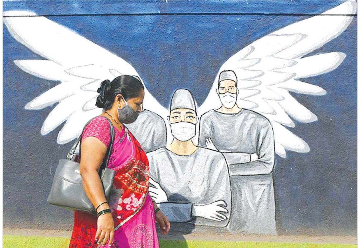
ဆေးဝန်ထမ်းများကို သူရဲကောင်းအဖြစ် သရုပ်ဖော်ရေးဆွဲထားသော နံရံဆေးရေးပန်းချီကို ဖြတ်ကျော်လျှောက်လှမ်းနေသော ပါးစပ်၊ နှာခေါင်းစည်း တပ်ဆင်ထားသည့် အမျိုးသမီးတစ်ဦးကို တွေ့ရစဉ်။

နေ့စဉ် ကိုဗစ်-၁၉ ကူးစက်ဖြစ်ပွားမှုတွေဟာ အကျဘက်ကို ပြနေတဲ့အတွက် ကိုဗစ်-၁၉ ကပ်ရောဂါကို ထိန်းချုပ်ဖို့ အိန္ဒိယရဲ့ ကြိုးပမ်းမှုဟာ အရာထင်တယ်လို့ ပြောရမှာဖြစ်ပါတယ်။ သို့သော်လည်း ကိုဗစ်-၁၉ တတိယအကျော့ရဲ့ ခြိမ်းခြောက်မှုကတော့ အချိန်ထိ တစ်လည်လည်နဲ့ မလွတ်မြောက်နိုင်သေးပါဘူး။