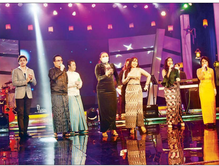
ပြန်ကြားရေးဝန်ကြီးဌာန ပြည်ထောင်စုဝန်ကြီး ဦးမောင်မောင်အုန်းနှင့် ရင်းနှီးမြှုပ်နှံမှုနှင့် နိုင်ငံခြားစီးပွားဆက်သွယ်ရေးဝန်ကြီးဌာန ပြည်ထောင်စုဝန်ကြီး ဦးအောင်နိုင်ဦး တို့ ရန်ကုန်မြို့ မြန်မာ့အသံနှင့် ရုပ်မြင်သံကြားတွင် အနုပညာရှင်များ၏ ဖျော်ဖြေတင်ဆက်မှုနှင့် တိုက်ရိုက်(Live) ရိုက်ကူးထုတ်လွှင့်မှုကို ကြည့်ရှုအားပေးကြစဉ်။

ရှေးဦးစွာ ပြည်ထောင်စုဝန်ကြီးများ သည် “မြူးကြွလှပ-ရောင်စုံညီ” ဖျော်ဖြေ ရေးအစီအစဉ်တွင် ပါဝင်သီဆိုကြမည့် ရုပ်ရှင်သရုပ်ဆောင်များနှင့် အဆိုတော် များ၊ တက်ရောက်အားပေး ကြည့်ရှုကြ မည့် လူရွှင်တော်အသင်းနှင့် ကိုလူချော အဖွဲ့၊ လူငယ်မျိုးဆက်သစ်အနုပညာရှင် များအား ရင်းရင်းနှီးနှီး တွေ့ဆုံနှုတ်ဆက် စကားပြောကြားပြီး အမှတ်တရ လက်ဆောင်များ ပေးအပ်သည်။