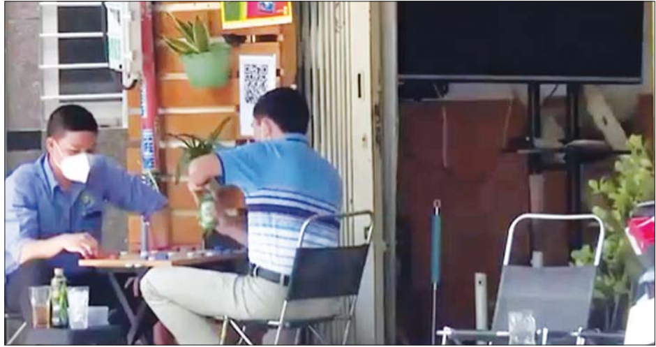
စားသောက်ဆိုင်တွင် ဆိုင်ထိုင်စားသောက်နေသည်ကို တွေ့ရစဉ်။

ပေးထားသည်။ လာရောက် စားသုံးသူပမာဏကိုလည်း ကပ် ရောဂါမတိုင်မီက လူဦးရေ၏ တစ် ဝက်နီးပါးကိုသာ ခွင့်ပြုပေးထား သည်။ နေ့စဉ်ကိုဗစ်-၁၉ ကူးစက် မှုနှုန်းမှာ မကြာသေးမီကာလ အတွင်း ၃၀၀၀ မှ ၄၀၀၀ အထိ လျော့ကျလာခဲ့သည်။