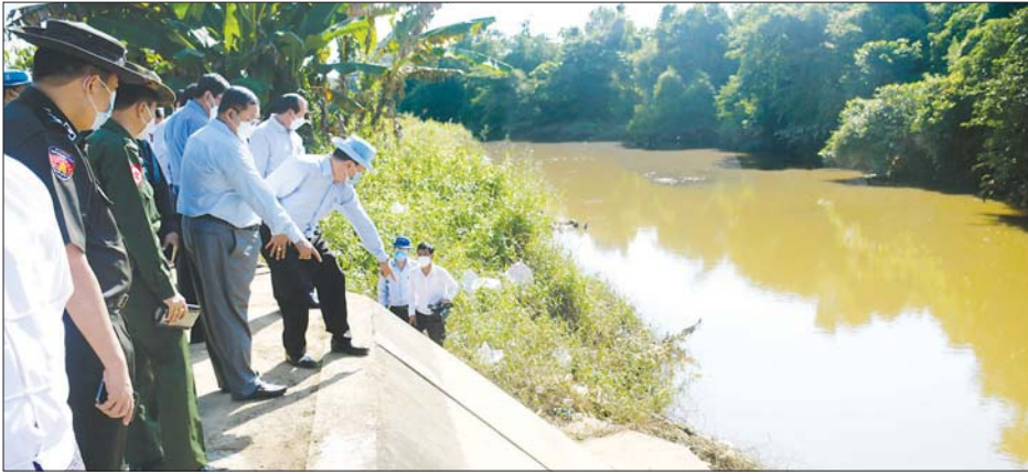
စီမံကိန်းဆောင်ရွက်မည့်နေရာကို တိုင်းဒေသကြီးဝန်ကြီးချုပ်နှင့်အဖွဲ့ ကြည့်ရှုနေစဉ်။

ရန်ကုန်တိုင်းဒေသကြီး ဝန်ကြီးချုပ် ဦးလှစိုးသည် တိုင်းဒေသကြီး ဝန်ကြီးများနှင့်အတူ မှော်ဘီနှင့် တိုက်ကြီးမြို့နယ်များရှိ စိုက်ပျိုးရေး၊ မွေးမြူရေးနှင့် လျှပ်စစ် မြစ်ရေတင် စီမံကိန်းများကို အောက်တိုဘာ ၂၇ ရက်က ကွင်းဆင်းစစ်ဆေးသည်။