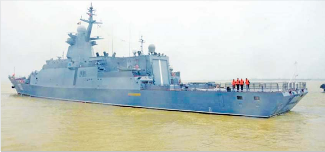
နေပြည်တော် အောက်တိုဘာ ၃၀