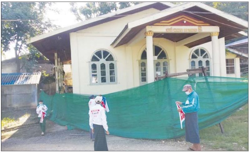
ကိုဗစ်-၁၉ လူနာဆောင်တစ်ခုကို ပိတ်သိမ်းနေစဉ်။

ဖောင်းပြင် အောက်တိုဘာ ၃၀ စစ်ကိုင်းတိုင်းဒေသကြီး ဖောင်းပြင်မြို့နယ် အတွင်း ကိုဗစ်-၁၉ ရောဂါကူးစက်ခံရသူများ အား ပြည်သူ့ကျန်းမာရေးဌာနနှင့် မင်းကွန်း မေ့ရိပ်သာတို့၌ စောင့်ကြည့်ကုသရေးစင်တာ များ ဖွင့်လှစ်၍ စောင့်ကြည့်ကုသပေးခဲ့ရာ ယခုအခါ ရောဂါပိုး ထပ်မံတွေ့ရှိရမှု မရှိခြင်း နှင့် လူနာများအားလုံး ကျန်းမာရေး ကောင်းမွန်၍ဆေးရုံမှ အားလုံးဆင်းခွင့်ရခြင်း ကြောင့် စင်တာများကို မြို့နယ် ကိုဗစ်-၁၉ ရောဂါ ကာကွယ်၊ ထိန်းချုပ်၊ ကုသရေး ကော်မတီ၏ဆုံးဖြတ်ချက်ဖြင့် ယမန်နေ့က ပိတ်သိမ်းလိုက်ကြောင်း သိရသည်။