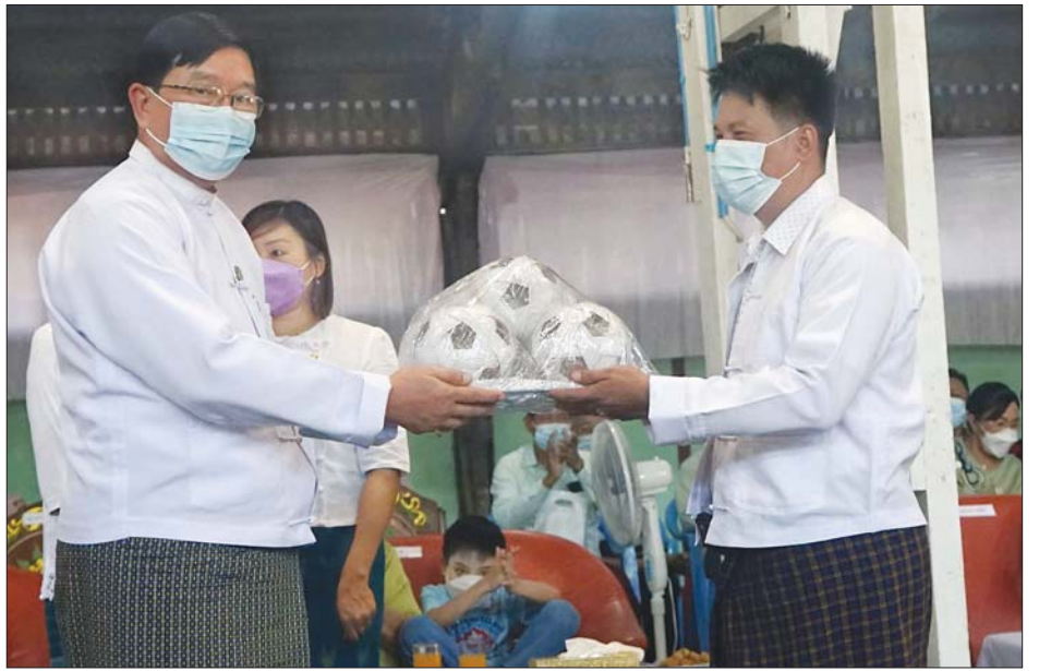
တိုင်းဒေသကြီးဝန်ကြီးချုပ်က သင်တန်းအတွက် ခြင်းလုံးများ ပေးအပ်စဉ်။