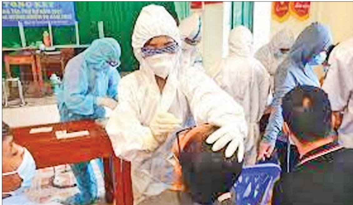
ဗီယက်နမ်နိုင်ငံတွင် ကိုဗစ်-၁၉ စမ်းသပ်စစ်ဆေးရန် တို့ဖတ်နမူနာရယူနေသည်ကို တွေ့ရစဉ်။