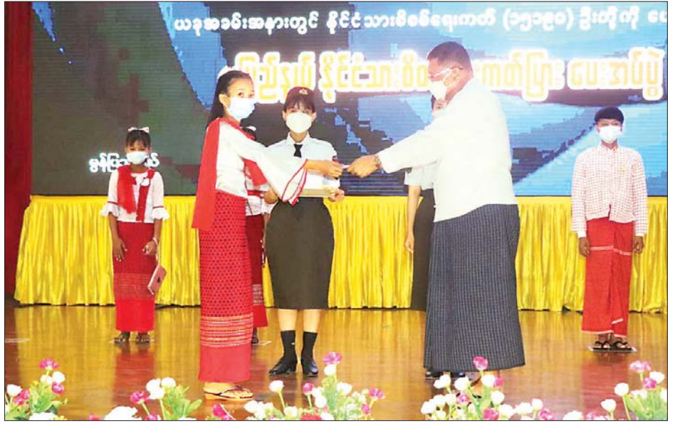
ကျောင်းသူများ၊ ရပ်ကွက်၊ ထုတ်ပေးနိုင်ရေး ဆောင်ရွက် ခုနှစ် နိုင်ငံဘာ ၃ ရက်နေ့အထိ ကျေးရွာ ပြည်သူများနှင့် တပ်ရင်း၊ နိုင်ခဲ့ပြီးဖြစ်ကြောင်းနှင့် ယင်း ၁၈ လတာကာလ ဆောင်ရွက် တပ်ဖွဲ့ မိသားစု ၁၅၁၉၀ အတွက် ပန်းခင်းစီမံချက်ကို ၂၀၂၁ ခုနှစ် ပေးမည်ဖြစ်ကြောင်း သိရသည်။ နိုင်ငံသားစိစစ်ရေး ကတ်ပြား မေ ၃ ရက်မှ စတင်ကာ ၂၀၂၂ ဇာဖြူဝင်း(ပြန်/ဆက်)

ပြီး(ယာပုံ) မွန်ပြည်နယ်အတွင်း ပန်းခင်းစီမံချက် မှတ်တမ်းဓာတ်ပုံ ပြခန်းများကို လှည့်လည်ကြည့်ရှုကြသည်။ အဆိုပါ ပန်းခင်းစီမံချက်ကို မွန်ပြည်နယ်အစိုးရအဖွဲ့၏ လမ်းညွှန်မှုဖြင့် ပြည်နယ်လူဝင်မှုကြီးကြပ်ရေးနှင့် ပြည်သူ့အင်အားဝန်ကြီးဌာနမှ မြို့နယ် ၁၀ မြို့နယ်ရှိ ပြည်သူများ၏ အိမ်ထောင်စုလူဦးရေစာရင်း ၂၁၂ စောင်နှင့် နိုင်ငံသားစိစစ်ရေးကတ် ၃၈၄၅၈ ဦးတို့အတွက် ဆောင်ရွက်ပေးပြီး အပြင် အလားတူ ကျောင်းသား