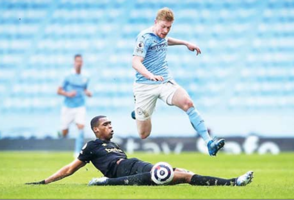
ယမန်နှစ်က ဝက်စ်ဟမ်းနှင့် မန်စီးတီးအသင်းတို့ ယှဉ်ပြိုင်ကစားစဉ်။

ကာရာဘောင်ဖလား စတုတ္ထအဆင့်ပွဲစဉ်အဖြစ် ဝက်စ်ဟမ်းအသင်းနှင့် လက်ရှိချန်ပီယံ မန်စီးတီးအသင်းတို့ပွဲစဉ်ကို အောက်တိုဘာ ၂၈ ရက် နံနက်တွင် အကြိတ်အနယ်ယှဉ်ပြိုင်ကစားကြမည်ဖြစ်သည်။ မန်စီးတီးအသင်းသည် ကာရာဘောင်ဖလားကို နည်းပြ ဂျွဲဒီယိုလားလက်ထက်တွင် ၂၀၁၇-၁၈ ၊ ၂၀၁၈-၁၉ ၊ ၂၀၁၉-၂၀ ၊ ၂၀၂၀-၂၁ လေးနှစ်ဆက်ဆွတ်ခူးရရှိထားသည်။ ဝက်စ်ဟမ်းအသင်းသည် ကာရာဘောင်ဖလား တတိယအဆင့်တွင် နာမည်ကြီး မန်ယူအသင်းကို လန်ဇီ၏ တစ်လုံးတည်းသော သွင်းဂိုးဖြင့် အနိုင်ရရှိကာ စတုတ္ထအဆင့်သို့ တက်ရောက်နိုင်ခဲ့ပြီး ပြိုင်ဘက် မန်စီးတီးအသင်းက အဆိုပါအဆင့်တွင် ပိုင်ကမ်ဘီအသင်းကို ခြောက်ဂိုး-တစ်ဂိုးဖြင့် အနိုင်ရရှိကာ စတုတ္ထအဆင့်သို့ တက်ရောက်လာနိုင်ခြင်းဖြစ်သည်။