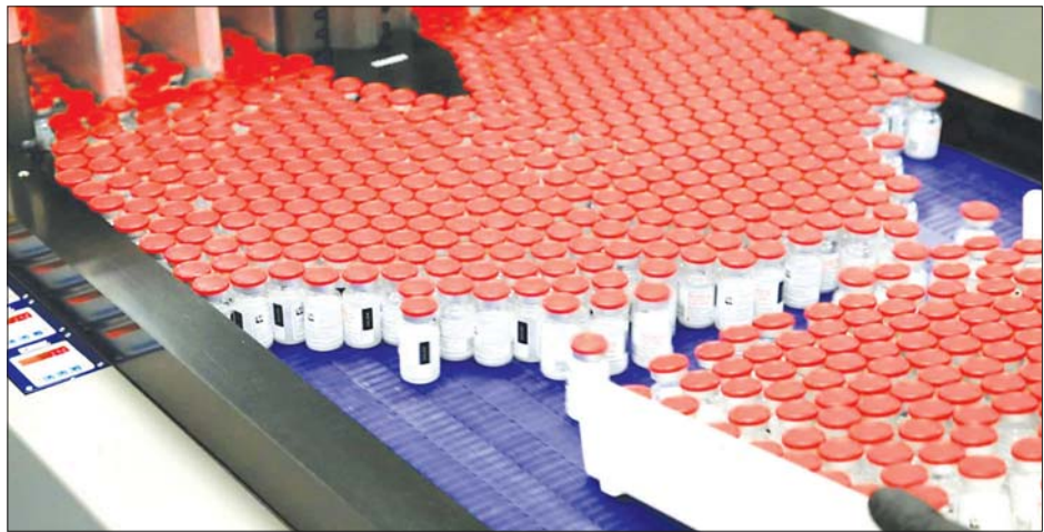
မော်ဒါနာ ကိုဗစ်-၁၉ ကာကွယ်ဆေး။

ဝါရှင်တန် အောက်တိုဘာ ၂၆ ပဋိပစ္စည်း တုံ့ပြန်မှုတွေ့ရှိရသည် သည့် လေ့လာမှုတွင် အသက် အသက်ခြောက်နှစ်မှ ၁၁ နှစ်ကြား ဟု အမေရိကန် ဇီဝနည်းပညာ ခြောက်နှစ်မှ ၁၂ နှစ်အောက် ကလေးများကို မော်ဒါနာ ကုမ္ပဏီကြီးဖြစ်သည့် မော်ဒါနာ ကလေးငယ် ၄၇၅၃ ဦးပါဝင်ခဲ့ပြီး ကလေးများအတွက် လုံခြုံစိတ်ချ ရပြီး စွမ်းဆောင်ရည် မြင့်မားသည့် ရက်တွင် ပြောသည်။ ကာကွယ်ဆေးရရှိရန် ရည်ရွယ် ထားသည်။