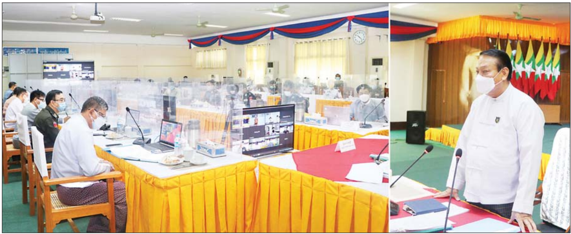
ပြည်ထောင်စုဝန်ကြီး ဦးခင်ရီ e-ID စနစ်လုပ်ငန်းကော်မတီ၊ ပထမအကြိမ် လုပ်ငန်းညှိနှိုင်းအစည်းအဝေးတွင် အမှာစကားပြောကြားစဉ်။

ရှေးဦးစွာ e-ID စနစ်လုပ်ငန်းကော်မတီ ဥက္ကဋ္ဌ၊ ပြည်ထောင်စုဝန်ကြီး ဦးခင်ရီက မိမိတို့ နိုင်ငံတွင် ဝန်ဆောင်မှု လုပ်ငန်းများဆောင်ရွက်ရာ၌ ထိရောက်လျင်မြန်စေပြီး နိုင်ငံတကာအဆင့်မီ ဆောင်ရွက်နိုင်ရေးအတွက် e-Government စနစ်ကို အကောင်အထည်ဖော် ဆောင်ရွက်ရန် လိုအပ်ပါကြောင်း၊ ယင်းလုပ်ငန်းစဉ်သည် ကမ္ဘာလုံးဆိုင်ရာ လိုအပ်ချက်အတိုင်း ဆောင်ရွက်ရခြင်းဖြစ်ကြောင်း၊ ကုလသမဂ္ဂ၏ စဉ်ဆက်မပြတ် ဖွံ့ဖြိုးတိုးတက်ရေး ရည်မှန်းချက် (SDG) နှင့်အညီ သက္ကရာဇ် ၂၀၃၀ ၌ နိုင်ငံသားတိုင်း မွေးစာရင်းအပါအဝင် တရားဝင်မှတ်ပုံတင် တစ်ခု ရရှိရေးဆိုသည့် လိုလားချက်၊ နိုင်ငံအတွင်း နေထိုင်သူ တစ်ဦးချင်းစီ၏ ကိုယ်ရေးအချက်အလက်များနှင့် ဇီဝဆိုင်ရာ အချက်အလက်များ ကောက်ယူပြီး လူတစ်ဦးချင်းစီကို ကိုယ်ပိုင်နံပါတ်တစ်ခုစီ ထုတ်ပေးရေးနှင့် e-Government Application များတွင် အသုံးပြုနိုင်ရေးဆိုသည့် လိုလားချက်၊ National Database စနစ်တည်ဆောက်၍ e-Government Application နှင့် Single Platform အဖြစ် ချိတ်ဆက်အသုံးပြုနိုင်ရေးဆိုသည့် လိုလားချက် စသည့်အချက်များသည် e-ID လုပ်ငန်းကို မဖြစ်မနေဆောင်ရွက်ရန် တိုက်တွန်းလမ်းညွှန်ချက်များပင် ဖြစ်ပါကြောင်း၊ မိမိတို့ဝန်ကြီးဌာနအနေဖြင့် e-ID စနစ်လုပ်ငန်းကို ယခင်ကတည်းက ဆောင်ရွက်ခဲ့ခြင်းဖြစ်ရာ လုပ်ငန်း