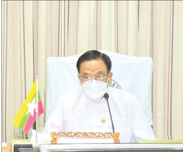
ပြည်ထောင်စုဝန်ကြီး ဒေါက်တာဌေးအောင် ကမ္ဘာ့ခရီးသွားလုပ်ငန်းအဖွဲ့ချုပ် (UNWTO) က စီစဉ်ကျင်းပသော The Future of Tourism World Summit သို့ Online မှ ပါဝင်တက်ရောက်ဆွေးနွေးစဉ်။

အဆိုပါ The Future of Tourism - Ministerial debate တွင် ပြည်ထောင်စုဝန်ကြီးက ခရီးသွားလုပ်ငန်းကဏ္ဍတွင် နည်းပညာအသုံးပြုခြင်းသည် စိန်ခေါ်မှုများကို ဖြေရှင်းနိုင်သည့် နည်းလမ်းတစ်ရပ်