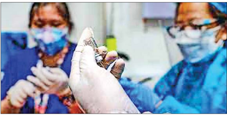
ဖိလစ်ပိုင်နိုင်ငံတွင် ကိုဗစ်-၁၉ ကာကွယ်ဆေးထိုးပေးရန် ဆောင်ရွက်စဉ်။

ဒေသတွင်း ကိုဗစ်-၁၉ ကူးစက်ဖြစ်ပွားမှုများ ကျဆင်းလာသောကြောင့် မြို့တော် မနီလာတွင်လည်း ကိုဗစ်-၁၉ ကူးစက်ဖြစ်ပွားမှုနှုန်း အကျောက်သို့ ရှိလာခဲ့သည်။ နေ့စဉ် ကိုဗစ်-၁၉ ကူးစက်မှုသည် စက်တင်ဘာ ၁၁ ရက်က ၂၆၃၀၃ ဦးဖြင့် အမြင့် ဆုံးဖြစ်ခဲ့သည်။