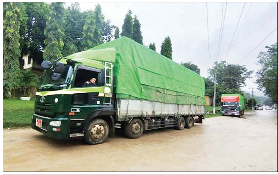
ချင်းရွှေဟော်နယ်စပ်ကုန်သွယ်ရေးစခန်းမှ ကိုဗစ်-၁၉ ရောဂါ ကာကွယ်၊ ထိန်းချုပ်၊ ကုသရေးဆိုင်ရာ ပစ္စည်းများ တင်သွင်းလာစဉ်။

နာခေါင်းစည်း (Mask) ၂၈ တန်တို့ကို တင်သွင်းခဲ့ပြီး Oxygen Bowser ယာဉ်တစ်စီးမှာ မြဝတီကုန်သွယ် ရေးဇုန်မှ ရန်ကုန်မြို့သို့ဖြစ်ကြောင်း သိရှိရသည်။ ကိုဗစ်-၁၉ရောဂါ ကာကွယ်၊ ထိန်းချုပ်၊ ကုသရေး ဆိုင်ရာ ပစ္စည်းများကို သက်ဆိုင်ရာဌာနများနှင့် ညှိနှိုင်းထားသည့် SOP များနှင့်အညီ ဦးစားပေး တင်သွင်းခွင့်ပြုပေးလျက်ရှိပါကြောင်းနှင့် ဆေးဝါး နှင့် ဆက်စပ်ပစ္စည်းများတင်သွင်းခြင်းနှင့် ဆက်စပ် သည့် အသိပေးကြေညာချက်များကိုလည်း အများ ပြည်သူ့သိရှိစေရန် ဝန်ကြီးဌာန Website ဖြစ်သည့် commerce.gov.mm တွင် ဝင်ရောက်ကြည့်ရှုနိုင်ရေး စီစဉ်ဆောင်ရွက်ပေးထားပါကြောင်း သိရှိရသည်။ သတင်းစဉ်