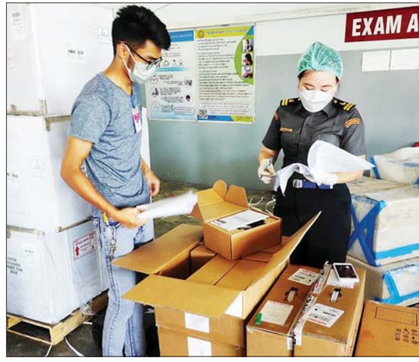
Shoe Cover ၃၂၅၆ Kg၊ Syringe ၂၅၀၆၄ခု၊ Gloves ၁၉၃၈၂ Kg တို့ကို ထုတ်ပေးခဲ့ကြောင်း သိရသည်။ သတင်းစဉ်

နေပြည်တော် အောက်တိုဘာ ၂၆ အကောက်ခွန်ဦးစီးဌာနအနေဖြင့် ကိုဗစ်-၁၉ ရောဂါကာကွယ်ထိန်းချုပ်ကုသရေးပစ္စည်းများအား ရေကြောင်း၊ လေကြောင်း၊ ဆိပ်ကမ်း၊ နယ်စပ်ဂိတ်အသီးသီးမှ နေ့စဉ်လွယ်ကူချောမွေ့စွာစစ်ဆေးထုတ်ပေးလျက်ရှိရာ ၂၆-၁၀-၂၀၂၁ ရက်နေ့၌ ရန်ကုန်အပြည်ပြည်ဆိုင်ရာလေဆိပ်တွင် ကုမ္ပဏီလေးခုမှ Food Supplement: Nutrition Powder For Diabetasol ၂၄၉၆ ခု၊ Lykavir Inj: ၉၆၀၀၊ Pluse Oximeter ၄၂၆ ခု၊ ရန်ကုန်ဆိပ်ကမ်းများမှ Disposable Test Tube ၁၁၂ ခု၊ Medical Grade Fluid-Resistance Mask ၄၀၀၀၀၊ Medical Grade Face Mask ၄၀၀၀၀၊ Oxygen Concentrator ငါးခု၊ ဆေးဝါးမျိုးစုံ ၂၁ မျိုး၊ ၁၀၂၈၃၁ ဒသမ ၀၇၉ Kg၊ နယ်စပ်(မြဝတီ၊ ချင်းရွှေဟော်)တွင် ကုမ္ပဏီခုနစ်ခုမှ Mask ၁၁၂၁၅ Kg၊ Liquid Oxygen ၁၅၂၆၂ M 3 ၊ PPE ၄၁၂၅၀၊