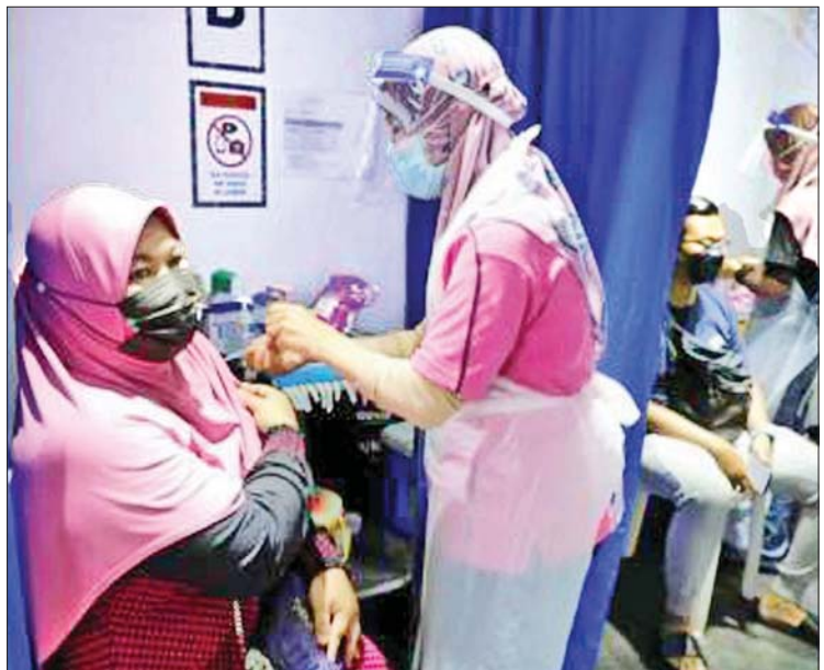
မလေးရှားနိုင်ငံတွင် ကျန်းမာရေးဝန်ထမ်းများက ကိုဗစ်-၁၉ ကာကွယ်ဆေးထိုးနှံပေး နေသည်ကို တွေ့ရစဉ်။

ကွာလာလမ်ပူ အောက်တိုဘာ ၂၆ မလေးရှားနိုင်ငံတွင် အောက်တိုဘာ ၂၆ ရက်က ကိုဗစ်-၁၉ ထပ်မံကူးစက်သူ ၄၇၈၂ ဦး တိုးလာကြောင်း အတည်ပြုဖော်ပြမှုနှင့်အတူ နိုင်ငံအတွင်း စုစုပေါင်း ကိုဗစ်-၁၉ ကူးစက်ဖြစ်ပွားသူပေါင်း ၂၄၆၄၉၈ ဦးအထိ ရှိလာပြီဖြစ်ကြောင်း ကျန်းမာရေး ဝန်ကြီးဌာနက ထုတ်ပြန်ဖော်ပြလိုက်သည်။