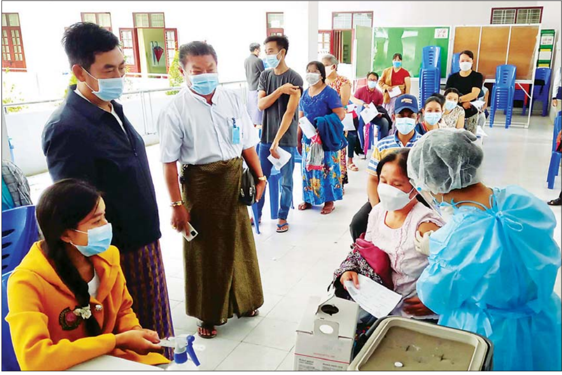
မန္တလေးတိုင်းဒေသကြီး ပြင်ဦးလွင်မြို့နယ် ရပ်ကွက်ကြီး (၁) ရှိ အစိုးရစက်မှုလက်မှုသိပ္ပံကျောင်း၌ ယနေ့နံနက်ပိုင်းမှစ၍ မြို့ပေါ်ရပ်ကွက်နေ ပြည်သူများအား ဒုတိယအကြိမ် ကိုဗစ်-၁၉ ကာကွယ်ဆေး ဆက်လက်ထိုးနှံပေးစဉ်။ ခရိုင် (ပြန်/ဆက်)