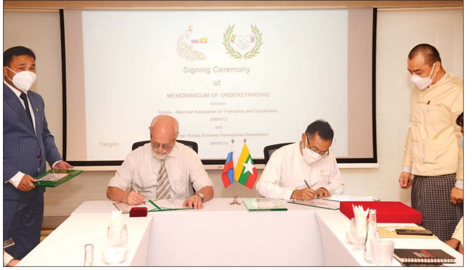
အလှန် လက်မှတ်ရေးထိုးကြသည်။ (အပေါ်ပုံ) ယခုရေးထိုးသော နားလည်မှုစာချုပ်လွှာသည် ရုရှား-မြန်မာ နှစ်နိုင်ငံအကြား စီးပွားရေး ပူးပေါင်းဆောင်ရွက်မှုများ ဖြစ်သော စိုက်ပျိုးရေးနှင့် မွေးမြူရေး ကဏ္ဍ၊ ဘဏ္ဍာရေးနှင့် ဘဏ်လုပ်ငန်းဆိုင်ရာ အတူတကွ စသည့် ကဏ္ဍများကို နှစ်နိုင်ငံ ပူးပေါင်းဆောင်ရွက်ရေး ကဏ္ဍ၊ လျှပ်စစ်နှင့် စွမ်းအင်၊ ရေနံနှင့် သဘာဝဓာတ်ငွေ့ဆိုင်ရာ အကြား ကုန်သွယ်မှုများ တိုးမြှင့်အကောင်အထည်ဖော်ရန်အတွက် အကြံပြုနိုင်သော သဘောတူရေးထိုးကြသော နားလည်မှု စာချုပ်လွှာ ဖြစ်ကြောင်း သိရသည်။ သတင်းစဉ်

လုပ်ငန်းများ အကျိုးတူ ပူးပေါင်းဆောင်ရွက်ခြင်းဖြင့် စီးပွားရေး ပိုမိုဖွံ့ဖြိုးတိုးတက်လာစေရန် လိုကြောင်း ပြောကြားသည်။ လက်မှတ်ရေးထိုး ယင်းနောက် ရုရှား-မြန်မာ ချစ်ကြည်ရေးနှင့် ပူးပေါင်းဆောင်ရွက်မှုအသင်း၏ ဒုတိယဥက္ကဋ္ဌနှင့် မြန်မာ-ရုရှား စီးပွားရေးဖွံ့ဖြိုးမှု အသင်း၏ ဥက္ကဋ္ဌတို့က ရုရှား-မြန်မာနှစ်နိုင်ငံ စီးပွားရေးနှင့် ကုန်သွယ်ရေး ပူးပေါင်းဆောင်ရွက်မှုဆိုင်ရာ သဘောတူနားလည်မှု စာချုပ်လွှာအား အပြန်