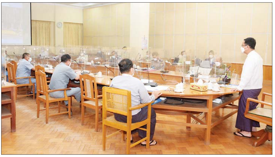
မြောက်လွတ်လပ်ရေးနေ့ အခမ်းအနား အောင်မြင်စွာ ကျင်းပနိုင်ရေးအတွက် မိမိတို့ ဆပ်ကော်မတီမှ တာဝန်ယူဆောင်ရွက်ရမည့် လုပ်ငန်းအလိုက် လိုအပ်ချက်မရှိစေရေး စနစ်တကျ စီမံကြီးကြပ် ဆောင်ရွက်ကြရန်နှင့် ဗဟိုကော်မတီမှ လမ်းညွှန်ချက်များနှင့်အညီ ဆောင်ရွက်ကြရန် နိဂုံးချုပ်စကား ပြောကြားခဲ့ကြောင်း သိရသည်။ သတင်းစဉ်

ထို့နောက် နေပြည်တော်ကောင်စီ ဥက္ကဋ္ဌ၊ မြို့တော်ဝန် ဒေါက်တာမောင်မောင်နိုင်က (၇၄)နှစ်