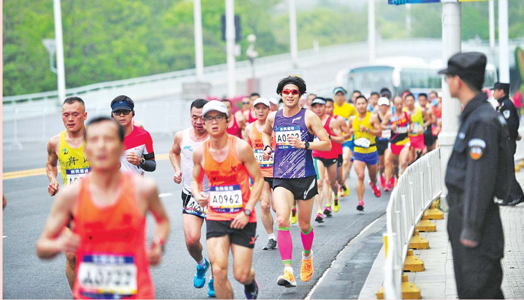
၂၀၁၉ ခုနှစ်က ကျင်းပခဲ့သည့် ဝူဟန်မာရသွန်ပြိုင်ပွဲ။

၂၀၂၁ ခုနှစ် ဝူဟန်မာရသွန်အားကစားပြိုင်ပွဲကို မူလက အောက်တိုဘာ ၂၄ ရက်တွင်ပြုလုပ်ရန် ရက်သတ်မှတ်ခဲ့သော်လည်း အဆိုပါပွဲကို ရွှေဆိုင်လိုက်ကြောင်း သိရသည်။ မာရသွန်ပြိုင်ပွဲ ထပ်မံကျင်းပမည့်ရက်ကို မသိရသေးချေ။ ဝူဟန်မာရသွန်ကော်မတီ၏ ကြေညာချက်အရ မြို့အချို့တွင် ကိုဗစ်-၁၉ ကူးစက်မှုများ တွေ့ရှိလာရသည့်အတွက် ရောဂါကူးစက်ပျံ့နှံ့မှုမှ အကာအကွယ်ပေးရန် မာရသွန်ပြိုင်ပွဲကျင်းပမည့်ရက်ကို ရွှေဆိုင်လိုက်ရခြင်းဖြစ်ကြောင်း သိရသည်။ ၂၀၂၁ ခုနှစ် ဝူဟန် မာရသွန် အပြေးပြိုင်ပွဲအတွက် စာရင်းပေးသွင်းထားသူများ ဆက်လက်ဝင်ခွင့်ရမည် ဖြစ်ပြီး စာရင်းပေးသွင်းခများကိုလည်း မကြာမီပြန်လည်ပေးချေသွားမည်ဟု ကြေညာချက်ထုတ်ပြန်ထားသည်။