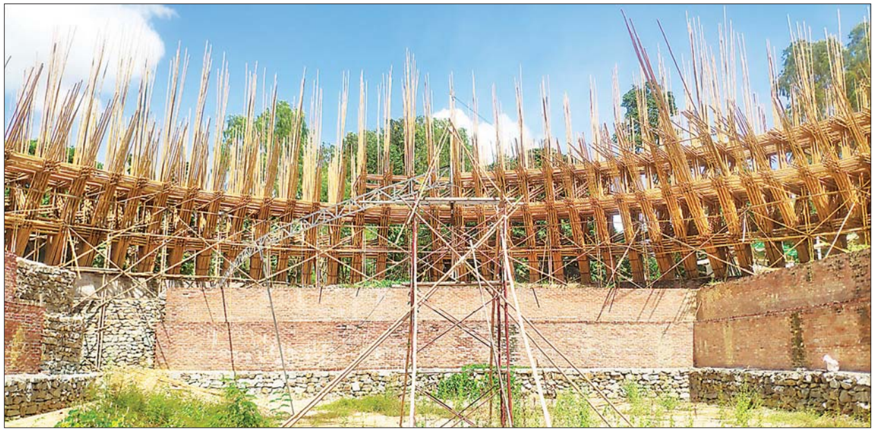
ကမ္ဘာ့ကပ်ကျော်ဆုတောင်းပြည့် ဝါးစေတီတော်ကြီးတည်ဆောက်နေမှုကို အတွင်းဘက်မှ တွေ့ရစဉ်။