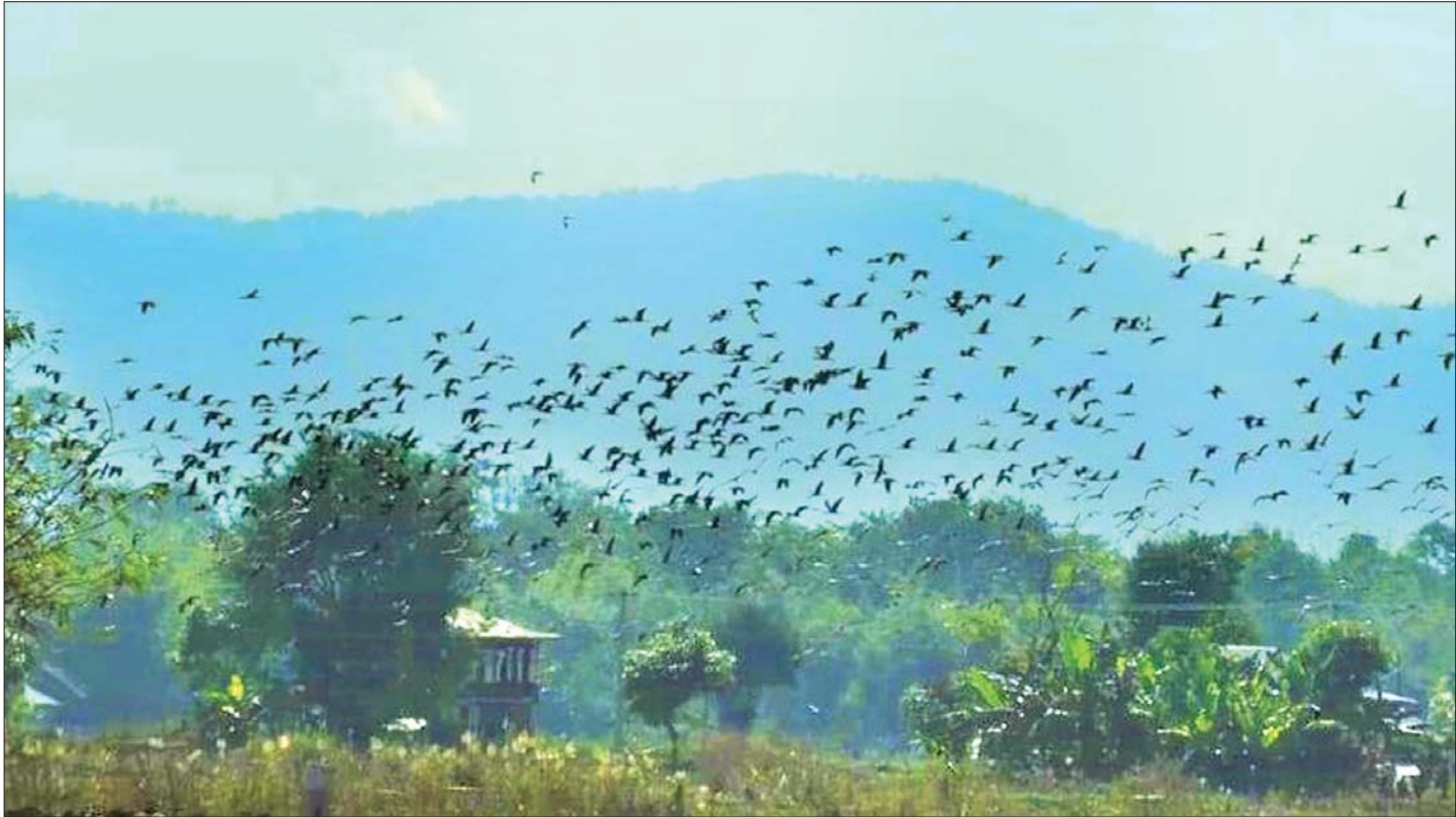
အင်းလေးကန် ဇီဝအဝန်းနယ်မြေအတွင်း ကျက်စားကြသည့် ငှက်များကိုတွေ့ရစဉ်။

သဘာဝကိုအခြေခံသော ခရီးသွားလုပ်ငန်းကို ကမ္ဘာ့နိုင်ငံများအနေဖြင့် နိုင်ငံ၏ဝင်ငွေတစ်ခုအဖြစ် အပြိုင်အဆိုင်ဖော်ဆောင်ခဲ့ကြရာ ကိုဗစ်-၁၉ ရောဂါ ကြုံတွေ့ရသော ကာလတွင်လည်း ရောဂါကာကွယ် ထိန်းချုပ်ရေးနည်းလမ်းများဖြင့် ခရီးသွားလုပ်ငန်းမှ ဝင်ငွေအချို့ ရရှိခဲ့ကြသည်။ ခရီးသွားလုပ်ငန်း၏ အဓိကအသက်သွေးကြောဖြစ်သော ဇီဝမျိုးစုံမျိုးကွဲ များနှင့် ဂေဟစနစ်များ ထိန်းသိမ်းထားရှိရာ ဇီဝ အဝန်းနယ်မြေနှစ်ခုတွင် နေထိုင်သော ဒေသခံတို့၏ လူမှုရေးနှင့်ပွားရေးကဏ္ဍများ ရေရှည်တည်တံ့ ခိုင်မြဲစေလျက် ထိုဒေသ၏ဂေဟစနစ်များ ဖွံ့ဖြိုး တိုးတက်မှုကို ဝိုင်းဝန်းထိန်းသိမ်း၍ လူနှင့်သဘာဝ သဟဇာတဖြစ်တည်မှုကို ပေါင်းစည်းပေးခြင်းဖြင့် အင်းလေးကန်နှင့် အင်းတော်ကြီးကန်တို့၏ ဇီဝ အဝန်းနယ်မြေနှစ်ခုကို ဆက်လက်ထိန်းသိမ်း စောင့်ရှောက်လျက်ရှိသည်။