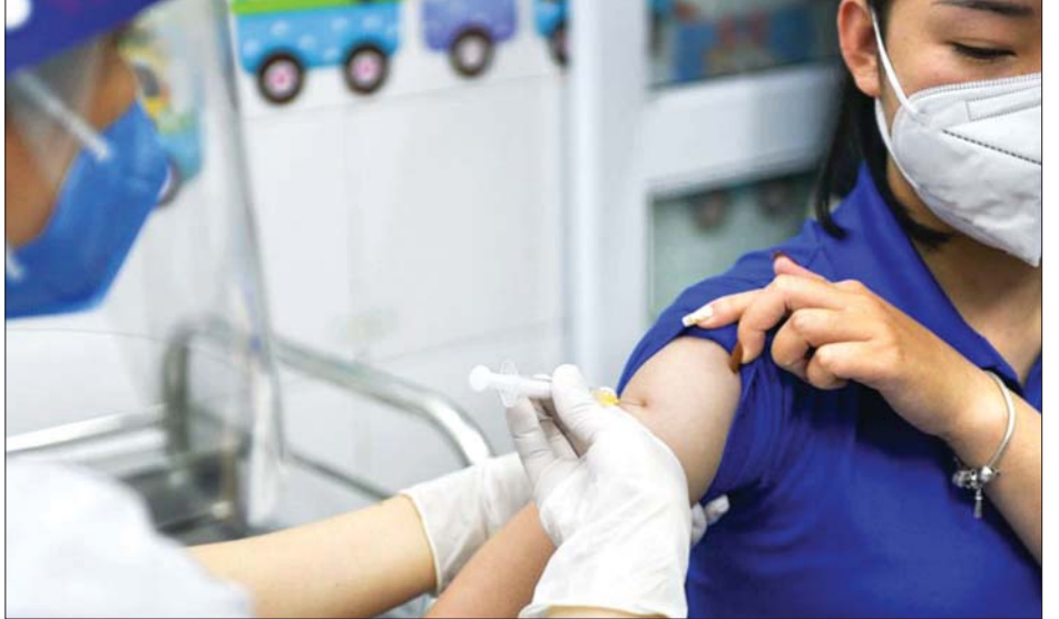
ဗီယက်နမ်နိုင်ငံတွင် ကိုဗစ်-၁၉ ကာကွယ်ဆေးထိုးပေးနေသည့်ကိုတွေ့ရစဉ်။