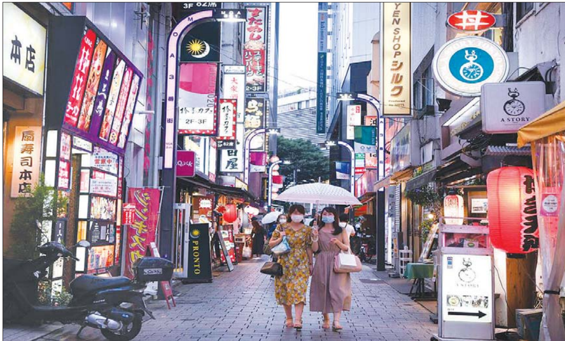
ဂျပန်နိုင်ငံ တိုကျိုမြို့။

ကိုဗစ်-၁၉ ကူးစက်ဖြစ်ပွားမှုကို အစပျိုး ဖြစ်စေတဲ့ စနေ၊ တနင်္ဂနွေရက် ရှည်တွေနဲ့ အားလပ်ရက်ရှည်တွေ ပြီးဆုံးသွားပြီး ဖြစ်တဲ့အတွက်ကြောင့် လည်းကောင်း၊ ပြည်သူတွေရဲ့ အပြုအမူ တွေ ပြောင်းလဲသွားတဲ့အတွက်ကြောင့် လည်းကောင်း၊ ဆေးရုံတွေ မအားမလပ် အောင် ပြည့်ကျပ်အလုပ်ရှုပ်နေပြီး