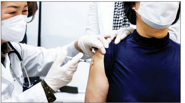
တောင်ကိုရီးယားတွင် ကိုဗစ်-၁၉ ကာကွယ်ဆေးထိုးနေသည့်ကို တွေ့ရစဉ်။

အပြည့်အဝ နာလန်ထူလာပြီးနောက် သတ်မှတ်စောင့်ကြည့်စင်တာမှ ဆင်းလာသူ ၂၅၆၂ ဦး အပါအဝင် စုစုပေါင်း ကိုဗစ်-၁၉