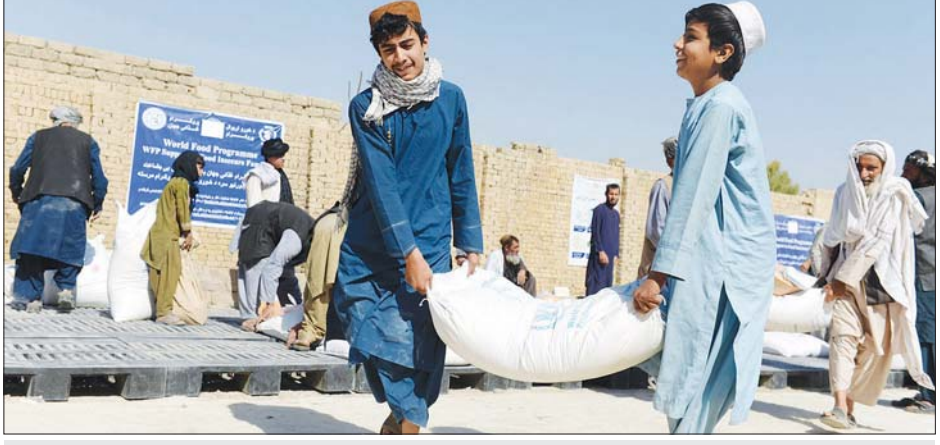
စားနပ်ရိက္ခာလာရောက်သယ်ဆောင်ကြသူများကို တွေ့ရစဉ်။

စုစုပေါင်း ၁၆၄၅၆ ဦးမှာ ကမ္ဘာ့စားနပ်ရိက္ခာအစီအစဉ်မှပေးသည့် စားနပ်ရိက္ခာ အကူအညီများကို ရရှိခဲ့ကြသည်ဟု ကမ္ဘာ့စားနပ်ရိက္ခာအစီအစဉ်က ပြောသည်။ ကမ္ဘာ့စားနပ်ရိက္ခာအစီအစဉ်ဖြင့် အချို့သော ပြည်နယ်များမှ ပြည်သူများမှာလည်း စားနပ်ရိက္ခာများ လက်ခံရရှိခဲ့ကြသည်။ ဆင်ဟွာ