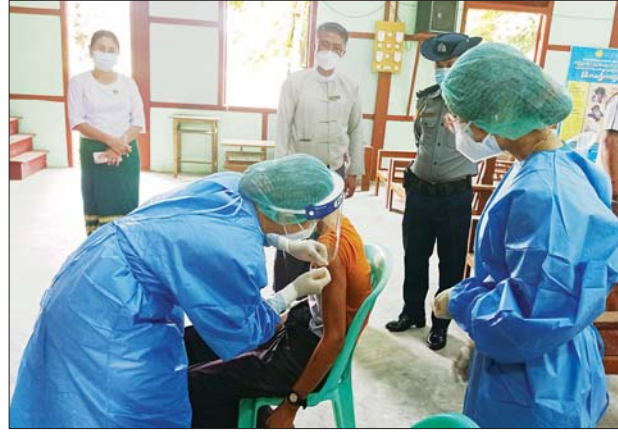
ကချင်ပြည်နယ် မိုးမောက်မြို့နယ်၌ အသက် ၁၂ နှစ်နှင့်အထက် ကျောင်းသား ကျောင်းသူများအား ကိုဗစ်-၁၉ ရောဂါကာကွယ်ဆေး ထိုးနှံပေးစဉ်။ မြို့နယ်(ပြန်/ဆက်)