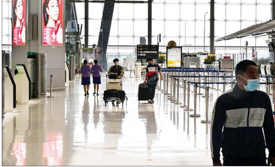
ထိုင်းနိုင်ငံ သုဝဏ္ဏဘူမိလေဆိပ်၌ ခရီးသွားများကို တွေ့ရစဉ်။