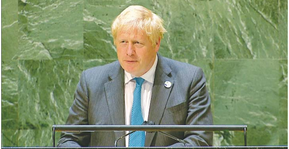
ဗြိတိန်ဝန်ကြီးချုပ် ဘောရစ်ဂျွန်ဆင်။

နေရာများတွင် ပါးစပ်၊ နှာခေါင်းစည်းမဖြစ်မနေတပ်ဆင်ရန် အမိန့်ထုတ်ခြင်း အပါအဝင် ကူးစက်မှုကို လျော့ချနိုင်ရေးအတွက် နောက်ထပ်အရေးယူဆောင်ရွက်မှုမျိုးကို အစိုးရက လုပ်ဆောင်ရန် ပျက်ကွက်သည်ဟု စွပ်စွဲခဲ့ခြင်းဖြစ်သည်။ ဗြိတိန်ဝန်ကြီးချုပ် ဘောရစ်ဂျွန်ဆင်ကမူ ကူးစက်မှုများမှာ များပြားလာသည်မှန်သော်လည်း ကျွမ်းကျင်သူများ ခန့်မှန်းထားသည့်ဘောင်အတွင်း၌ သာရှိသည်ဟု အောက်တိုဘာ ၂၁ ရက်က ပြောသည်။ ဇူလိုင်လအတွင်းက ချမှတ်ခဲ့သည့် အစီအစဉ်အတိုင်း ဆက်လက်လုပ်ဆောင်နေကြောင်း လွန်ခဲ့သည့်တစ်နှစ်ကနှင့် နှိုင်းယှဉ်လျှင် အခြေအနေများ တိုးတက်ကောင်းမွန်လာပြီဖြစ်ကြောင်းနှင့် ကာကွယ်ဆေးထိုးပေးနိုင်ခြင်း၏ အကျိုးကျေးဇူးများပင်ဖြစ်သည်ဟု ဘောရစ်ဂျွန်ဆင်က ပြောသည်။ အပိုဆောင်း၍ ကာကွယ်ဆေးထိုးပေးမည့် အစီအစဉ်ကိုလည်း ဆက်လက်လုပ်ဆောင်သွားမည်