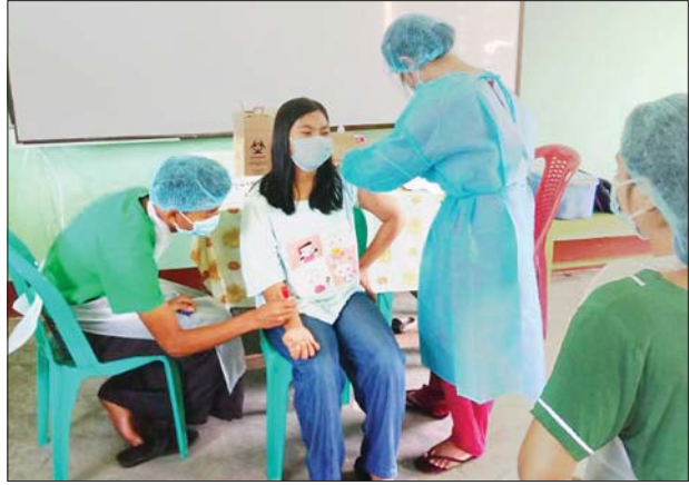
ကရင်ပြည်နယ် ကမမောင်းမြို့၌ အသက် ၁၂ နှစ်နှင့်အထက် ကျောင်းသား ကျောင်းသူများအား ကိုဗစ်-၁၉ ရောဂါကာကွယ်ဆေး ထိုးနှံပေးစဉ်။ လင်းသန့်(ပြန်/ဆက်)