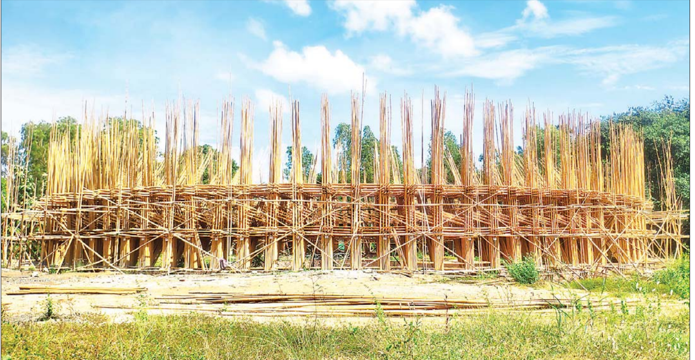
ကမ္ဘာ့ကပ်ကျော်ဆုတောင်းပြည့် ဝါးစေတီတော်ကြီးတည်ဆောက်နေမှုကို တွေ့ရစဉ်။

နေပြည်တော် အောက်တိုဘာ ၂၂ နေပြည်တော်ကောင်စီနယ်မြေ လယ်ဝေးမြို့နယ် သာဝတ္တိမြို့ရှိ တောင်သုံးလုံးဇေတဝန်ပရိယတ္တိ စာသင်တိုက်နာယကဆရာတော်ဘဒ္ဒန္တဝေပုလ္လမဟာ ထေရ်မြတ်ကြီး သီတင်းသုံးတော်မူသည့် ကျောင်း ပရိဝုဏ်အတွင်း ကမ္ဘာ့အကြီးဆုံးဝါးစေတီ တစ်ဆူ ဖြစ်လာမည့် ကမ္ဘာ့ကပ်ကျော် ဆုတောင်းပြည့် ဝါးစေတီတော်ကြီးကို အများပြည်သူ စုပေါင်းအလှူငွေများဖြင့် တည်ထားလျက်ရှိသည်။ အဆိုပါဝါးစေတီတော်ကြီးကို ယခုနှစ် ဇွန်လ ၁၂ ရက်တွင် ပန္နက်တော်တင်မင်္ဂလာအခမ်းအနား ကျင်းပခဲ့ပြီး ယခုအောက်တိုဘာလအထိ လေးလ အတွင်း အမြင့်ပေ ၁၅ ပေအထိ ပြီးမြောက်ပြီဖြစ်သည်။ ကမ္ဘာ့ကပ်ကျော်ဆုတောင်းပြည့် ဝါးစေတီတော်ကြီးသည် မြေအောက်လိုဏ်ဂူ တစ်ထပ်ပါဝင်မည် ဖြစ်ကာ လုံးပတ်မှာ ပေ ၁၅၀၊ အမြင့်ပေ ၁၈၀ ရှိမည် ဖြစ်သည်။ ကျောင်းပရိဝုဏ်အတွင်း ဝါးစေတီတော်ကြီးနှင့်အတူ ရေကန်အသင့်ကြာအသင့်၊ မုစလိန္န ရေကန်တို့ကို သုံးနေရာသုံးဌာန တစ်ပြိုင်နက်တည်း တည်ထားလျက်ရှိသည်။ စာမျက်နှာ ၁၁ ကော်လံ ၁ *