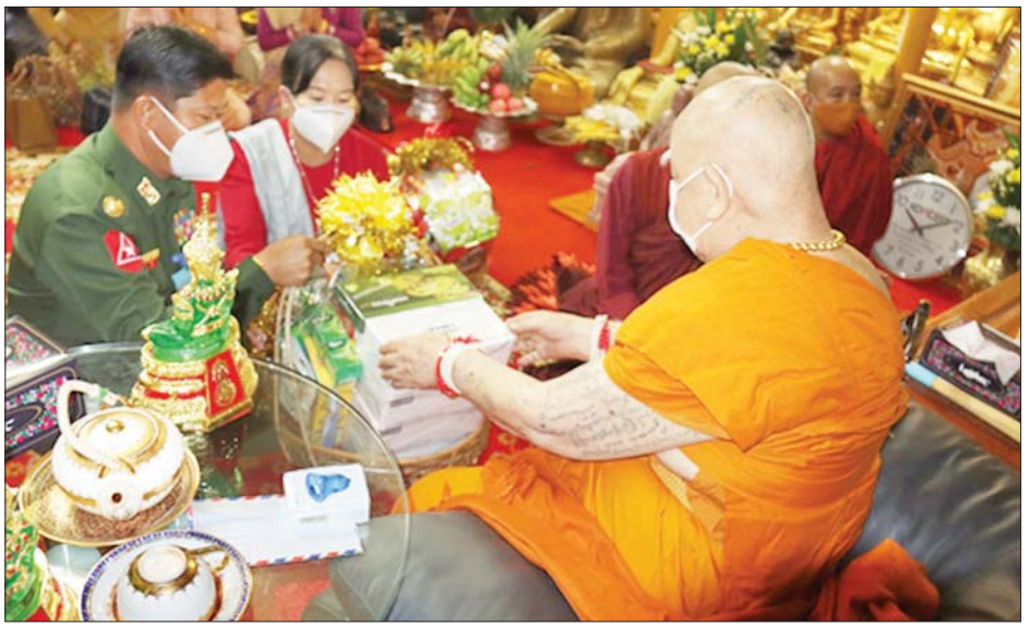
တိုင်းစစ်ဌာနချုပ်အသီးသီးမှ တိုင်းမှူးများနှင့် ခွဲကြဲကြောင်း သတင်းရရှိသည်။ တာဝန်ရှိသူများက သွားရောက်ဆက်ကပ်လှူဒါန်း သတင်းစဉ်

မြန်အောင်မြို့နယ် ကနောင်မြို့ ဘုရားကြီးကျောင်းတိုက်၊ စစ်ကိုင်းတိုင်းဒေသကြီး နာဂကိုယ်ပိုင်အုပ်ချုပ်ခွင့်ရဒေသ လဟယ်မြို့ရှိ ထေရဝါဒဗုဒ္ဓသာသနာပြု(ဗဟို)ကျောင်းတိုက်နှင့် လဟယ်မြို့ ထေရဝါဒဗုဒ္ဓသာသနာပြုသီလရှင်ကျောင်းတိုက်၊ မန္တလေးတိုင်းဒေသကြီး အောင်မြေသာစံမြို့ မဟာခေမိကာရာမသစ်ဆိမ့်ကျောင်းတိုက်တို့ရှိ ဆရာတော်၊ သံဃာတော်များနှင့် သာသနာ့နယ်ဝင် သီလရှင်များအတွက် ဆွမ်းဆန်တော်၊ ဆီ၊ ဆား၊ ပဲ အမယ်လေးမျိုး၊ ကိုဗစ်-၁၉ ရောဂါကာကွယ်ရေး အထောက်အကူပြုပစ္စည်းများ၊ နေ့ဆွမ်းများနှင့် လှူဖွယ်ပစ္စည်းများကို သက်ဆိုင်ရာ