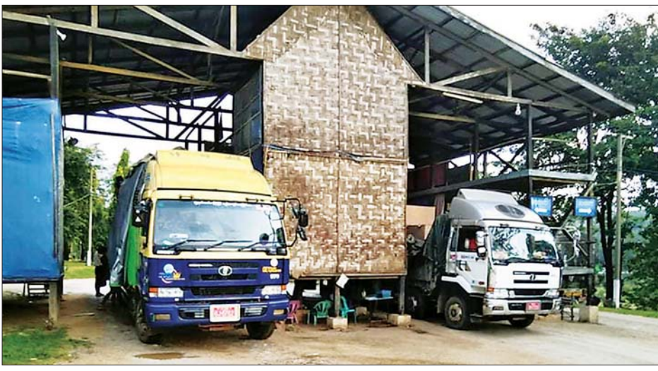
Oxygen Plant ကိုးခု၊ Test Kit တင်သွင်းခဲ့ပြီး Oxygen Plant ကိုး လေးခု၊ ချင်းရွှေဟော်မှ ဆင်ပေါင်ဝဲ ၁၀၅ခုနှင့် လက်အိတ် ရှစ်တန် ခုမှာ ဆိပ်ကမ်းမှ ရန်ကုန်မြို့သို့ မြို့၊ မင်းတုန်းမြို့၊ သရက်မြို့၊

နေပြည်တော် အောက်တိုဘာ ၂၂ စီးပွားရေးနှင့် ကူးသန်းရောင်း ဝယ်ရေး ဝန်ကြီးဌာနအနေဖြင့် ကိုဗစ်-၁၉ ရောဂါ ကာကွယ်၊ ထိန်း ချုပ်၊ ကုသရေးဆိုင်ရာ ပစ္စည်းများ ကို လေကြောင်း၊ ရေကြောင်းနှင့် နယ်စပ်ကုန်သွယ်ရေး စခန်းများမှ နှောင့်နှေးကြန့်ကြာမှုမရှိ တင် သွင်းနိုင်ရေးအတွက် အချိန်နှင့် တစ်ပြေးညီ စီစဉ်ဆောင်ရွက်ပေး လျက်ရှိရာ ယနေ့တွင် ရန်ကုန် အပြည်ပြည်ဆိုင်ရာ လေဆိပ်၊ ဆိပ်ကမ်းများ၊ မြဝတီနှင့် ချင်းရွှေ ဟော် ကုန်သွယ်ရေးစခန်းနှစ်ခု တို့မှ တင်သွင်းရာ၌ ကုမ္ပဏီ နှစ်ခုမှ ယာဉ်စီးရေး လေးစီးဖြင့်