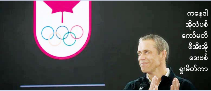
ကနေဒါ အိုလံပစ် ကော်မတီ စီအီးအို ဒေးဗစ် ရူးမိတ်ကာ