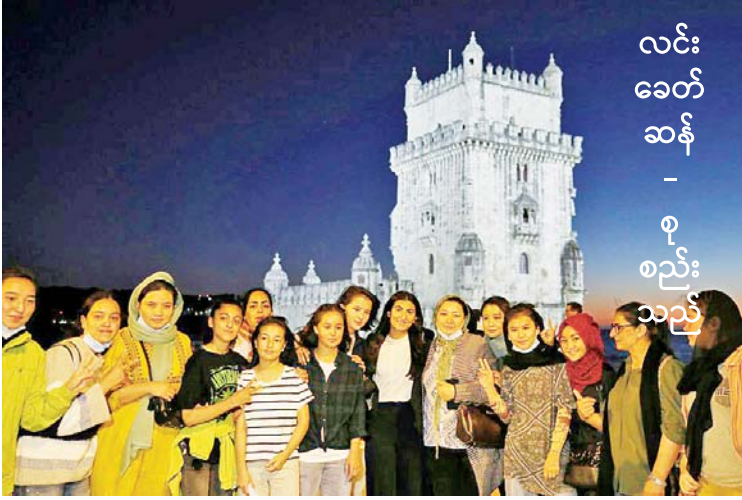
လင်းခေတ်ဆန် - စည်းသည်