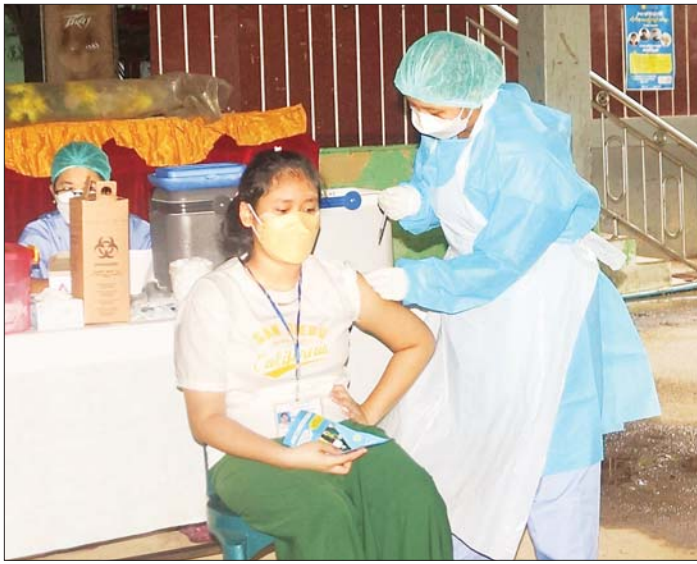
အထက် (၂) ဗဟန်းတွင် ကိုဗစ်-၁၉ ရောဂါ ကာကွယ်ဆေးထိုးနှံပေးစဉ်။

ရန်ကုန် အောက်တိုဘာ ၁၈ ရန်ကုန်တိုင်းဒေသကြီးအတွင်းရှိ အခြေခံပညာ ကျောင်းစုရပ်များ၌ အသက် ၁၂ နှစ်နှင့်အထက် ကျောင်းသား ကျောင်းသူများအား ကိုဗစ်-၁၉ ရောဂါ ကာကွယ်ဆေးကို ဆက်လက်ထိုးနှံပေးလျက်ရှိသည်။ ဗဟန်းမြို့နယ် ဆရာစံရပ်ကွက် ကမ္ဘာအေး ဘုရားလမ်းရှိ အမှတ် (၂) အခြေခံပညာ အထက်တန်း ကျောင်း နယ်လမ်းစုရပ်၌ ဗဟန်းမြို့နယ်အတွင်းရှိ အသက် ၁၂ နှစ်နှင့်အထက် အခြေခံပညာကျောင်း များမှ ကျောင်းသား ကျောင်းသူများ ကိုဗစ်-၁၉ ရောဂါ ကာကွယ်ဆေး ထိုးနှံပေးလျက်ရှိရာ ကာကွယ် ဆေး လာရောက်ထိုးနှံကြသော ကျောင်းသား ကျောင်းသူများအား ကျန်းမာရေး ဝန်ထမ်းများနှင့် ကြက်ခြေနီတပ်ဖွဲ့ဝင်များက ကိုယ်အပူချိန်တိုင်းပေး ခြင်း၊ သွေးအတွင်း အောက်ဆီဂျင်ပမာဏ တိုင်းတာ ပေးခြင်းတို့ကို ဆောင်ရွက်ပေးကြပြီး ကျောင်းသား ကျောင်းသူများအား ကိုဗစ်-၁၉ ရောဂါ ကာကွယ် ဆေးထိုးနှံပေးကြသည်။