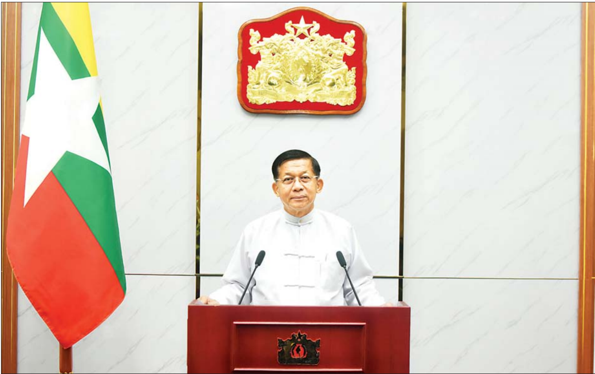
နိုင်ငံတော်စီမံအုပ်ချုပ်ရေးကောင်စီဥက္ကဋ္ဌ နိုင်ငံတော်ဝန်ကြီးချုပ် ဗိုလ်ချုပ်မှူးကြီး မင်းအောင်လှိုင် ပြည်သူ့လူထုသို့ မိန့်ခွန်းပြောကြားစဉ်။

ချစ်ခင်လေးစားအပ်တဲ့ တိုင်းရင်းသားမိဘပြည်သူများခင်ဗျာ မကြာခင် ရောက်ရှိလာတော့မယ့် သီတင်းကျွတ်အခါသမယမှာ အားလုံးပဲ စိတ်၏ချမ်းသာခြင်း၊ ကိုယ်၏ကျန်းမာခြင်းနဲ့ ပြည့်စုံပါစေကြောင်း နှုတ်ခွန်းဆက်သမေတ္တာပို့သအပ်ပါတယ်။ ကျွန်တော်တို့ မြန်မာတို့ရဲ့ယဉ်ကျေးမှုထုံးတမ်းစဉ်လာမှာတော့ နှစ်သစ်ကူးသင်္ကြန်အခါသမယနဲ့ သီတင်းကျွတ်ပွဲတို့ဟာ အထွတ်အမြတ်ထားတဲ့ ပွဲများဖြစ်ပါတယ်။ ကိုဗစ်ကာလမှာ အကျပ်အတည်းများ ရှိနေတဲ့အတွက် ကြောင့် ဒီပွဲအခမ်းအနားတွေကို မလုပ်ဆောင်နိုင်သော်လည်းဘဲ ကျွန်တော်တို့အနေနဲ့ ဒီအခမ်းအနားတွေကို အလေးအနက်ထားပါကြောင်း ပြောကြားလိုတယ်။ ၂၀၂၀ ပြည့်နှစ် နိုဝင်ဘာလ ၈ ရက်နေ့မှာ ပြုလုပ်ခဲ့တဲ့ ပါတီစုံအထွေထွေရွေးကောက်ပွဲနဲ့ ပတ်သက်ပြီး မဲမသမာမှုတွေ ကြီးမားစွာဖြစ်ပွားခဲ့တာ မိဘပြည်သူများသိရှိပြီးဖြစ်ပါတယ်။ ရွေးကောက်ပွဲမှာဖြစ်ပွားခဲ့တဲ့ ရက်ဖွယ်ရာကောင်းတဲ့ မရိုးသားမှုများဟာ တိုင်းပြည်အတွက် အရပ်ဆိုးအကျည်းတန်တဲ့ ဖြစ်စဉ်များဖြစ်ပါတယ်။ ဒါကိုကျွန်တော်တို့ သင်ခန်းစာယူပြီးတော့မှ နောင်မှာဒီလိုမဖြစ်အောင် ဆက်လက်လုပ်ဆောင်သွားရမှာ ဖြစ်ပါတယ်။ ဒီမဲမသမာမှုနဲ့ပတ်သက်ပြီး ဖြစ်ပေါ်လာတဲ့ ဖြစ်ရပ်တွေကို စိစစ်တဲ့အခါမှာ စာမျက်နှာ ၃ ကော်လံ ၁ □