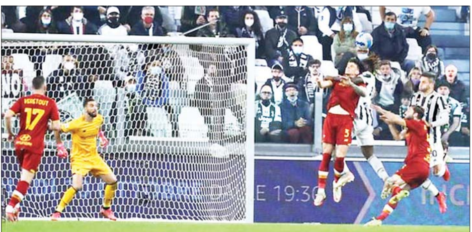
ဂျူဗင်တပ်စ်တိုက်စစ်ကစားသမား မွိုက်စ်ကီန်း ရိုးမားအသင်းဘက်သို့ ဂိုးသွင်းယူရန် ကြိုးပမ်းစဉ်။

○ ကျော့ဖိုးမှ ပြိုင်ဘက် ရိုးမားအသင်းက စီးရီးအေ၌ ယခုနှစ်ရာသီ သုံးပွဲမြောက်ရှုံးပွဲနှင့် ကြုံတွေ့ခဲ့ရခြင်းဖြစ်သည်။ ရာသီအစပွဲစဉ်များတွင် ပုံမှန်ခြေစွမ်းရရှိရန် ရုန်းကန်ခဲ့ရသည့် ဂျူဗင်တပ်စ်အသင်းသည် နောက်ပိုင်း ပွဲစဉ်များတွင် ငါးပွဲဆက်နိုင်ပွဲရရှိသည်အထိ ခြေစွမ်းပြသလာနိုင်ခဲ့သည်။ ဂျူဗင်တပ်စ်အသင်းသည် အောက်တိုဘာ ၂၁ ရက်တွင် ချန်ပီယံလိဂ်ပြိုင်ပွဲအဖြစ် ဇင်းနစ်အသင်းနှင့် ယှဉ်ပြိုင်ကစားရန်ရှိသော်လည်း ယနေ့ပွဲစဉ်ကို အဓိက ကစားသမားအစုံအလင်ဖြင့် ပွဲထွက်လာခဲ့သည်။ ပြိုင်ဘက် ရိုးမားအသင်းကလည်း အောက်တိုဘာ ၂၁ ရက်တွင် ယူရိုပါလိဂ်ပြိုင်ပွဲယှဉ်ပြိုင်ကစားရန်ရှိသော်လည်း အဓိက ကစားသမား