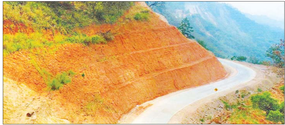
နမ့်စန်-မိုးနဲ-တာဆန်း-မိုင်းတုံ-မိုင်းဆတ် ပြည်ထောင်စုလမ်းမကြီး။

ကျိုင်းတုံ အောက်တိုဘာ ၁၈ ပြည်ထောင်စုလမ်းမကြီး (NH.23) မိုင်ရှိသည်။ စက်တင်ဘာ ၃၀ ရှမ်းပြည်နယ်ရှိ နမ့်စန်- မိုးနဲ- တာဆန်း- မိုင်းတုံ- မိုင်းဆတ် အရှည်မှာ ၇၃/၆ ဒသမ ၉၅ မှာ ၁၈ ပေအကျယ် ကွန်ကရစ်