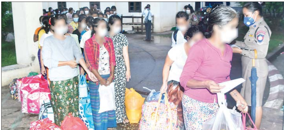
အင်းစိန်အကျဉ်းထောင်မှ ယနေ့ညနေပိုင်းတွင် ပြန်လည်လွတ်မြောက်လာသူများကို တွေ့ရစဉ်။ ပိုင်းတွင် လွတ်ပေးခဲ့ပြီး ကျန် ၄၉၇ ဦးအား အောက်တိုဘာ ၁၉ ရက် နံနက်ပိုင်းတွင် ဆက်လက် လွတ်ပေးသွားမည်ဖြစ်ကြောင်း သိရသည်။