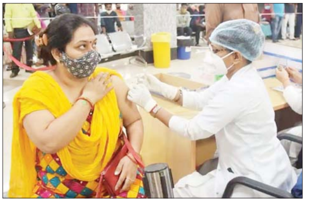
အိန္ဒိယနိုင်ငံတွင် ကိုဗစ်-၁၉ ကာကွယ်ဆေး ထိုးပေးနေစဉ်။

ကိုဗစ်-၁၉ ကြောင့် ထပ်မံသေဆုံးသူ ၁၆၆ ဦးရှိလာမှုနှင့်အတူ စုစုပေါင်း ကိုဗစ်-၁၉ ကြောင့် သေဆုံးသူ ၄၅၂၂၉၀ အထိ ရှိလာခဲ့ သည်။ နိုင်ငံအတွင်း လတ်တလောကိုဗစ်-၁၉ ကူးစက်လျက်ရှိသူ ၁၈၉၆၉၄ ဦးအထိရှိပြီး လွန်ခဲ့သော ၂၄ နာရီအတွင်း ကိုဗစ်-၁၉ ကူးစက်သူ ၆၁၅၂ ဦးအထိလျော့နည်းလာခဲ့သည်။ ကိုဗစ်-၁၉ ကူးစက်မှုမှ ပျောက်ကင်း၍ ဆေးရုံမှ ဆင်းလာသူ စုစုပေါင်း ၃၃၄၃၉၃၃ ဦးရှိလာပြီဖြစ်ပြီး လွန်ခဲ့သော ၂၄ နာရီအတွင်း ဆေးရုံမှ ဆင်းလာသူ ၁၉၅၈၂ ဦး ရှိ သည်။ ဆင်ဟွာ