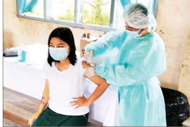
ရခိုင်ပြည်နယ် ရသေ့တောင်မြို့နယ်။ မြို့နယ်(ပြန်/ဆက်)