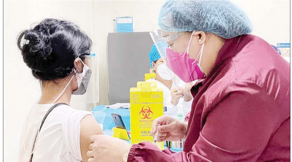
ဖိလစ်ပိုင်နိုင်ငံ မြို့တော်မနီလာတွင် အသက် ၁၂ နှစ်အထက် ကလေးငယ်တစ်ဦးကို ကိုဗစ်-၁၉ ကာကွယ် ဆေး ထိုးပေးနေသည်ကိုတွေ့ရစဉ်။

ဘန်ဒါဆီရီဘီဂါဝန် အောက်တိုဘာ ၁၈ ဘရူနိုင်းနိုင်ငံတွင် အောက်တိုဘာ ၁၈ ရက်က ကိုဗစ်-၁၉ ထပ်မံ ကူးစက်သူ ၁၈၇ ဦးတိုးလာသောကြောင့် စုစုပေါင်း နိုင်ငံအတွင်း ကိုဗစ်-၁၉ ကူးစက်သူပေါင်း ၁၁၀၄၇ ဦးအထိရှိလာခဲ့သည်။ ကိုဗစ်-၁၉ ထပ်မံကူးစက်သူအားလုံးသည် ပြည်တွင်းကူးစက်ခံရ သူများဖြစ်ကြောင်း ဘရူနိုင်းကျန်းမာရေးဝန်ကြီးဌာန၏ သတင်း ထုတ်ပြန်ချက်အရ သိရသည်။ ရောဂါခြေချုပ်စင်တာတွင် ကြီးကြပ်ကုသ မှုခံယူနေသော လက်ရှိ ကိုဗစ်-၁၉ ကူးစက်သူ ၂၇၂၈ ဦးရှိသည်။ ကိုဗစ်- ၁၉ ကူးစက်မှုမှ ပြန်လည်ကောင်းမွန်လာသူပေါင်း ၈၂၄၂ ဦးရှိသည်။ ဘော်နီယိုကျွန်းတွင်တည်ရှိသည့် ပသီဘုရင်အုပ်စိုးရာနိုင်ငံတွင် ကိုဗစ်-၁၉ စတင်ဖြစ်ပွားချိန်မှစကာ ယခုအချိန်အထိ ကိုဗစ်-၁၉ ကြောင့် သေဆုံးသူပေါင်းမှာ ၇၇ ဦးအထိ ရှိလာပြီဖြစ်သည်။ ဆင်ဟွာ