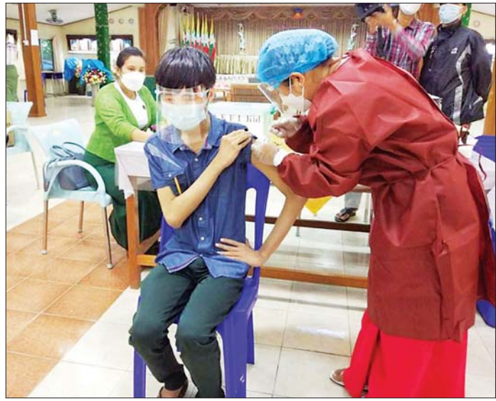
အထက် (၂) မင်္ဂလာဒုံတွင် ကိုဗစ်-၁၉ ရောဂါ ကာကွယ်ဆေးထိုးနှံပေးစဉ်။