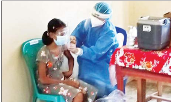
မွန်ပြည်နယ် ချောင်းဆုံမြို့နယ်။ မြို့နယ်(ပြန်/ဆက်)