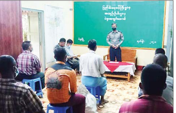
အကျဉ်းသားများ စုစုပေါင်း ၁၅ ဦးခန့် တက်ရောက်ကြပြီး ဒုတိယ မြို့နယ်ရဲတပ်ဖွဲ့မှူးနှင့် တာဝန်ရှိသူများက ဆုံးမ စကားများပြောကြားကာ ပြစ်ဒဏ် ကျခံနေရသော အကျဉ်းသား ခုနစ် ဦးအား ပြန်လည်စေလွှတ်ပေးခဲ့ ကြောင်း သိရသည်။ ခရိုင်(ပြန်/ဆက်)