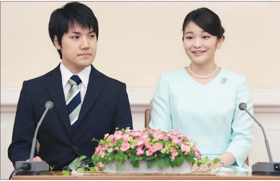
ဂျပန်တော်ဝင်မင်းသမီးမာကိုနှင့် ၎င်း၏ ချစ်သူ ကိုမိုရိုကီ။

၎င်းသည် ဥပဒေကျောင်း တက်ရန်အတွက် အမေရိကန် ပြည်ထောင်စုသို့ သွားရောက်ခဲ့ သည်။ မင်းသမီးမာကိုသည် အိမ်ရှေ့မင်းသား အာကီရှိနို၏ အကြီးဆုံးသမီးဖြစ်ပြီး ၎င်းတို့ လက်ထပ်ပွဲမတိုင်မီ ကိုမိုရိုသည် မင်းသမီး၏မိဘများကို ဦးစွာ