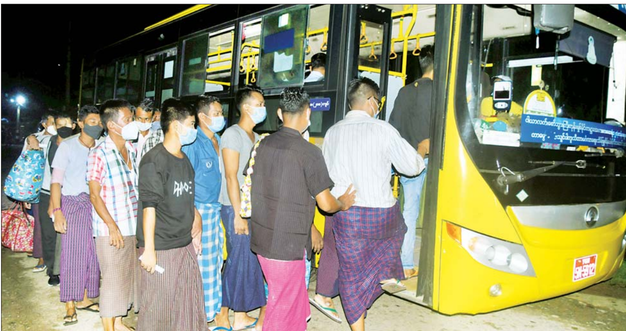
အင်းစိန်အကျဉ်းထောင်မှ လွတ်မြောက်လာသူများအား YBS ယာဉ်ဖြင့် ပြန်လည်ပို့ဆောင်ပေးစဉ်။

နိုင်ငံတော်စီမံအုပ်ချုပ်ရေးကောင်စီသည် နိုင်ငံတော်တည်ငြိမ်အေးချမ်းရေးနှင့် စစ်မှန်သည့် ဒီမိုကရေစီစနစ် ဖော်ဆောင်နိုင်ရေးအတွက် ချမှတ်ထားသည့် ရှေ့လုပ်ငန်းစဉ် (၅)ရပ်နှင့်အညီ ဆောင်ရွက်လျက်ရှိရာ နိုင်ငံရေးအစွန်းရောက်များ၊ အကြမ်းဖက်အုပ်စုများဖြစ်သည့် CRPH ၊ NUG တို့၏ သွေးထိုးလှုံ့ဆော်မှုများနှင့် အကြောင်းအမျိုးမျိုးကြောင့် စာမျက်နှာ ၇ ကော်လံ ၄ ●