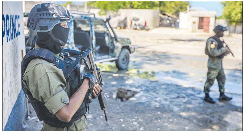
ဟေတီနိုင်ငံ ပေါ်တိုပရင့်စ်မြို့တွင် လုံခြုံရေးပေးနေသည့် ဟေတီတပ်ဖွဲ့ဝင်များကို တွေ့ရစဉ်။