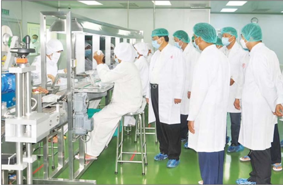
ပြည်ထောင်စုဝန်ကြီး ဒေါက်တာချာလီသန်း ဆေးဝါးစက်ရုံ (အင်ရောင်း)အတွင်း သွေးကြောသွင်းဆေးရည် အမျိုးမျိုး ထုတ်လုပ်နေမှုအခြေအနေကို ကြည့်ရှုစစ်ဆေးစဉ်။

နေပြည်တော် အောက်တိုဘာ ၁၈ စက်မှုဝန်ကြီးဌာန ပြည်ထောင်စုဝန်ကြီး ဒေါက်တာ ချာလီသန်းသည် ဒုတိယဝန်ကြီး ဦးကိုလွင်၊ မြန်မာ့ဆေးဝါးလုပ်ငန်း ဦးဆောင်ညွှန်ကြားရေးမှူး၊ အထွေထွေမန်နေဂျာများနှင့်အတူ အောက်တိုဘာ ၁၆ ရက် နံနက်ပိုင်းတွင် မန္တလေးတိုင်းဒေသကြီး ပြင်ဦးလွင်မြို့ရှိ ဆေးဝါးကုန်ကြမ်းစိုက်ခင်းများသို့ ရောက်ရှိပြီး ဆေးဝါးကုန်ကြမ်းပင်မျိုးစုံ ထိန်းထား နိုင်ရေး စနစ်တကျဆောင်ရွက်ကြရန် မှာကြားကာ ငှက်ဖျားရောဂါ ကုသဆေးထုတ်လုပ်နိုင်ရန် အာတီ မီးစီးယာများ စိုက်ပျိုးထားရှိမှုအခြေအနေနှင့် ပျိုးပင် ခြံတို့ကို ကြည့်ရှုစစ်ဆေးသည်။