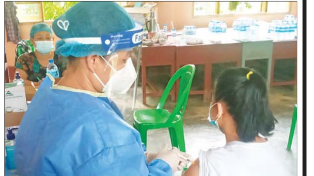
ကရင်ပြည်နယ် ဘားအံမြို့နယ်။ ခရိုင်(ပြန်/ဆက်)