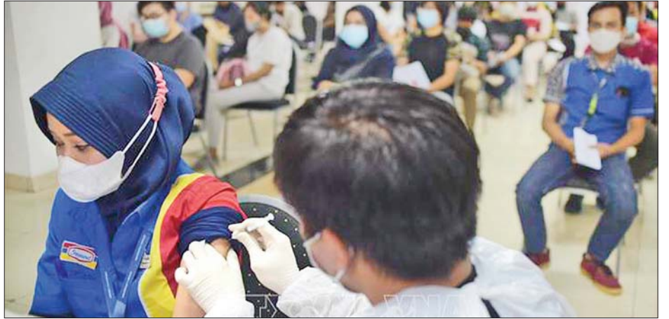
အင်ဒိုနီးရှားနိုင်ငံတွင် အမျိုးသမီးတစ်ဦးအား ကျန်းမာရေးဝန်ထမ်းတစ်ဦးက ကိုဗစ်-၁၉ ကာကွယ်ဆေး ထိုးပေးနေစဉ်။

တစ်ကြိမ် ထိုးနှံပြီးသူပေါင်း ၁၀၇ ဒသမ ၉၈ သန်းရှိကြောင်းနှင့် တတိယအကြိမ် အပိုဆောင်း ကိုဗစ်-၁၉ ကာကွယ်ဆေး ထိုးနှံ ပြီးသူပေါင်း ၁ ဒသမ ၀၇ သန်း ရှိကြောင်း ကျန်းမာရေးဝန်ကြီး ဌာနက သတင်းထုတ်ပြန်ကြေညာ လိုက်သည်။ အစိုးရသည် ပြည်သူ ၂၀၈ ဒသမ ၂၆ သန်းကို ကာကွယ်ဆေး ထိုးပေးနိုင်ရန် ရည်မှန်းချက်ထား ဆောင်ရွက်လျက်ရှိသည်။ ဆင်ဟွာ