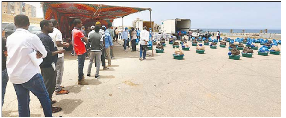
ထရီပိုလီမြို့တွင် စားနပ်ရိက္ခာအကူအညီယူရန် စောင့်ဆိုင်းနေကြသူများကို ၂၀၂၀ ပြည့်နှစ် မေ ၁၃ ရက်က တွေ့ရစဉ်။

ဥရောပကမ်းခြေများသို့ သွားရောက်လိုသည့် တရား မကြောင်းသဖွယ် ဖြစ်နေဆဲဖြစ်သည်။ မဝင် ရွှေ့ပြောင်းနေထိုင်သူများတွက် အဓိကလမ်း