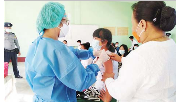
ရှမ်းပြည်နယ်(မြောက်ပိုင်း) သီပေါမြို့နယ်။ အိဇာချို (ပြန်/ဆက်)