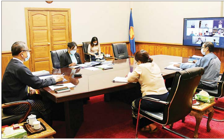
ဆွေးနွေးပြောကြား အစည်းအဝေးတွင် လုပ်ငန်းကော်မတီဥက္ကဋ္ဌ

နေပြည်တော် အောက်တိုဘာ ၁၈ ကိုဗစ်-၁၉ ကြောင့် ဖြစ်ပေါ်လာနိုင်သည့် စီးပွားရေး သက်ရောက်မှုများအပေါ် ကုစားရေးလုပ်ငန်း ကော်မတီ၏ အစည်းအဝေးအမှတ်စဉ် (၇/၂၀၂၁) ကို ယနေ့ မွန်းလွဲပိုင်းတွင် ရင်းနှီးမြှုပ်နှံမှုနှင့် နိုင်ငံခြား စီးပွားဆက်သွယ်ရေးဝန်ကြီးဌာန၊ ရုံးအမှတ် (၁) ၌ ဗီဒီယိုကွန်ဖရင့်ဖြင့် ကျင်းပသည်။ (ယာပုံ)