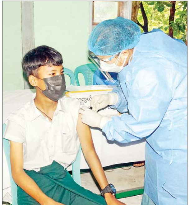
ဒက္ခိဏသီရိမြို့နယ်တွင် အသက် ၁၂ နှစ်နှင့်အထက် ကျောင်းသား တစ်ဦးကို ကိုဗစ်-၁၉ ရောဂါ ကာကွယ်ဆေးထိုးနှံပေးစဉ်။ ထွန်းထွန်းဝင်း(ပြန်/ဆက်)