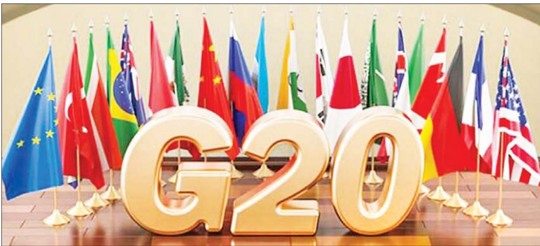
ဂျီ-၂၀ အဖွဲ့ဝင် နိုင်ငံအလံများကို တွေ့ရစဉ်။

အင်ဒိုနီးရှား အပန်းဖြေကမ်းခြေတစ်ခုဖြစ်သည့် ဘာလီကို နိုင်ငံတကာ ခရီးသွား များအတွက် အောက်တိုဘာ ၁၄ ရက်က ပြန်လည်ဖွင့်လှစ်ပေးခဲ့သည်။