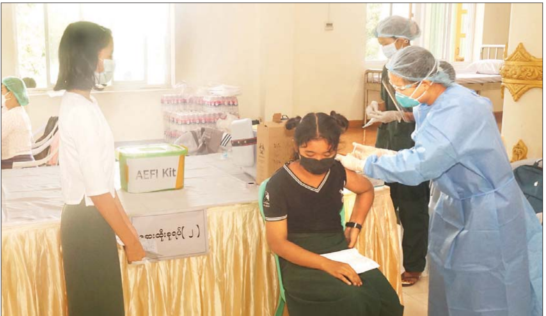
ပျဉ်းမနားမြို့နယ်တွင် ကျောင်းသား ကျောင်းသူများကို ကိုဗစ်-၁၉ ရောဂါကာကွယ်ဆေးထိုးနှံပေးစဉ်။ ဇော်ဖြိုး(ပြန်/ဆက်)