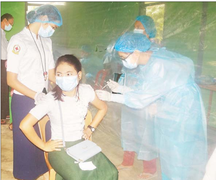
တပ်ကုန်းမြို့နယ်တွင် အသက် ၁၂ နှစ်နှင့်အထက် ကျောင်းသူတစ်ဦးကို ကိုဗစ်-၁၉ ရောဂါ ကာကွယ်ဆေးထိုးနှံပေးစဉ်။ တင်စိုးလွင်(ပြန်/ဆက်)