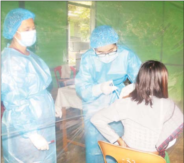
ဥတ္တရသီရိမြို့နယ်တွင် အသက် ၁၂ နှစ်နှင့်အထက် ကျောင်းသူ တစ်ဦးကို ကိုဗစ်-၁၉ ရောဂါ ကာကွယ်ဆေးထိုးနှံပေးစဉ်။ ခရိုင်(ပြန်/ဆက်)