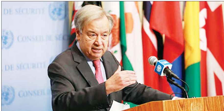
ကုလသမဂ္ဂအတွင်းရေးမှူးချုပ် အန်တိုနီယို ဂူတာရက်စ်။

ဂျီနီဗာ အောက်တိုဘာ ၁၄ ကုလသမဂ္ဂအတွင်းရေးမှူးချုပ် အန်တိုနီယို ဂူတာရက်စ်က ၂၀၂၂ ဘတ်ဂျက်အတွက် အမေရိကန် ဒေါ်လာ ၃ ဒသမ ၁၂ ဘီလီယံနီးပါးကို အောက်တိုဘာ ၁၃ ရက်က တောင်းဆိုလိုက်သည်။ မိမိတို့ကို အပ်နှင်းထားသော လုပ်ပိုင်ခွင့်များကို အပြည့်အဝ အကောင်အထည်ဖော်ရမည်ဖြစ်သော ကြောင့် အမေရိကန်ဒေါ်လာ ၃ ဒသမ ၁၂ ဘီလီယံ လိုအပ်ကြောင်း ဘတ်ဂျက်ရေးရာစီမံခန့်ခွဲရေး ဆိုင်ရာ ကုလသမဂ္ဂအထွေထွေညီလာခံ၏ ငါးကြိမ်မြောက်ကော်မတီတွင် ပြောကြားလိုက်သည်။ အဆိုပြု ဘတ်ဂျက်သည် အလုပ်ရာထူးနေရာ စုစုပေါင်း ၁၀၀၀၅ ခုကို လွှမ်းမိုးနိုင်မည်ဖြစ်သည်။