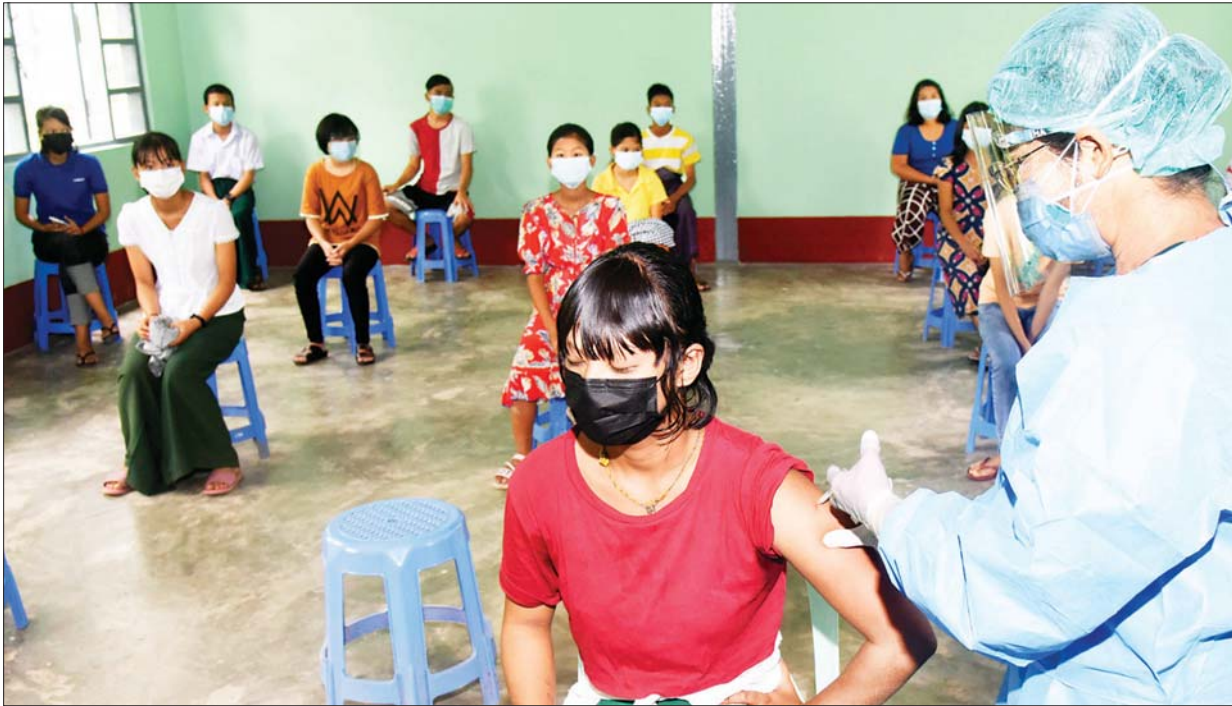
လယ်ဝေးမြို့နယ်တွင် အသက် ၁၂ နှစ်နှင့်အထက် ကျောင်းသား ကျောင်းသူများကို ကိုဗစ်-၁၉ ရောဂါ ကာကွယ်ဆေးထိုးနှံပေးစဉ်။ သတင်းစဉ်

ပြည်ထောင်စုနယ်မြေ နေပြည်တော်ရှိ မြို့နယ်များ၌ အသက် ၁၂ နှစ်နှင့်အထက် ကျောင်းသား ကျောင်းသူများအား ကိုဗစ်-၁၉ ရောဂါကာကွယ်ဆေး ထိုးနှံပေးခြင်းကို အောက်တိုဘာ ၁၂ ရက်ကစတင်၍ ထိုးနှံပေးခဲ့ရာ ယနေ့နံနက်ပိုင်းတွင် ကျောင်းသား ကျောင်းသူများအား ကာကွယ်ဆေးဆက်လက်ထိုးနှံပေးမှု မြင်ကွင်းများကို ဖော်ပြလိုက်ရပါသည်-