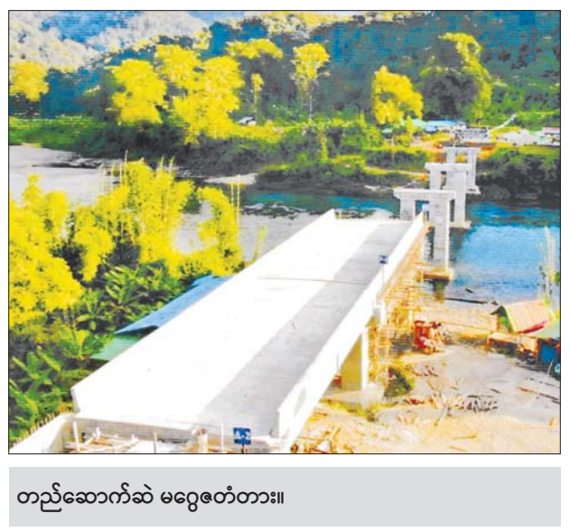
တည်ဆောက်ဆဲ မဂ္ဂေတံတား။

ပြီဖြစ်သည်။ ကချင်ပြည်နယ် ခေါင်လန်ဖူးကားလမ်း ကဆန်ခဲချောင်းပေါ်မှ တံတားအမှတ် (၂/၁) မဂ္ဂေတံတားသည် ၂၀၂၂-၂၀၂၃ ဘဏ္ဍာနှစ် တွင် တည်ဆောက်ပြီးစီးမည်ဖြစ်ကြောင်း သိရသည်။ ယခင်က ယင်းတံတားနေရာတွင် ဂျစ်ကားကူးကြိုးတံတားသာရှိပြီး ယခု မဂ္ဂေ တံတား တည်ဆောက်ပြီးစီးပါက ပူတာအိုမှ ခေါင်လန်ဖူးသို့ မော်တော်ယာဉ်များ ရာသီ မရွေး သွားလာနိုင်တော့မည်ဖြစ်ရာ ဒေသ ဖွံ့ဖြိုးရေးအတွက် အထောက်အကူပြုမည့် တံတားဖြစ်သည်။