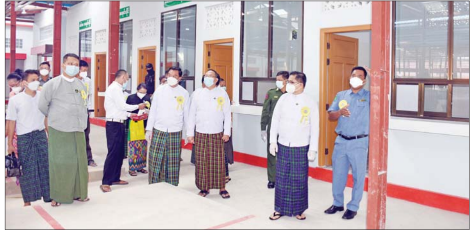
ဈေးသစ်အတွင်း ပြည်နယ်ဝန်ကြီးချုပ် လိုက်လံကြည့်ရှုစစ်ဆေးစဉ်။

မြန်ကြီးနား အောက်တိုဘာ ၁၄ ကချင်ပြည်နယ် ဝိုင်းမော်မြို့၌ မြို့နယ် စည်ပင်သာယာရေး