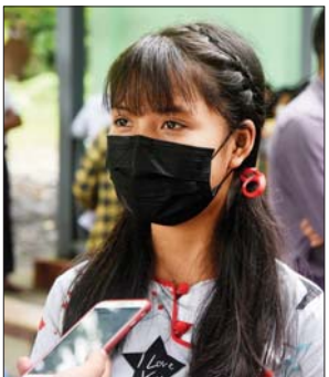
မဟာနုပွင့်နိုင်