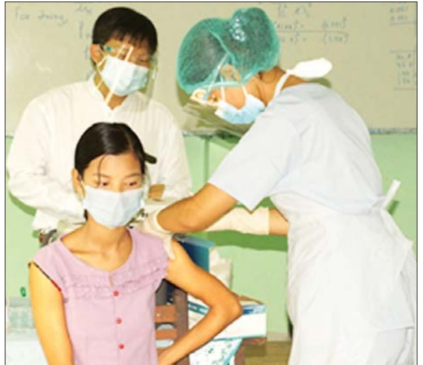
ဇေယျာသီရိမြို့နယ်တွင် အသက် ၁၂ နှစ်နှင့်အထက် ကျောင်းသူ တစ်ဦးကို ကိုဗစ်-၁၉ ရောဂါ ကာကွယ်ဆေးထိုးနှံပေးစဉ်။ အေးလင်းထွန်း(ပြန်/ဆက်)