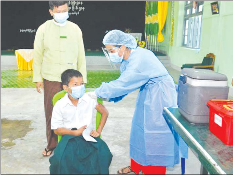
ဥတ္တရသီရိမြို့နယ်တွင် ကျောင်းသားတစ်ဦးအား ကိုဗစ်-၁၉ ကာကွယ်ဆေး ထိုးပေးနေစဉ်။

သို့ဖြစ်၍ မိဘတို့၏ “ပေးဝေနှီးရင်း” ရမည့် ဝတ္တရားထဲတွင် “ယဉ်ကျေးမှုကိုယ်ခံအား” တိုးမြှင့်ပေးရန် မနိုင်ဝန်ကို ထိမ်းကြရပေ၏။ ဤတာဝန်ကို “ကိုဗစ်-၁၉ ကပ်ကာလကြီး” ထဲတွင် ထိမ်းရခက်သည် မှန်သော်လည်း မိဘတို့ လွယ်လွယ်ကူကူနှင့် မြှင့်တင်ပေးနိုင်သော “ကျန်းမာရေးကိုယ်ခံအား” ထဲတွင် ကိုဗစ်-၁၉ ကူးစက်ရောဂါကာကွယ်ဆေး ရှိနေပြီဖြစ်ကြောင်း၊ အသက် ၁၂ နှစ် အရွယ်ကပင် စတင်၍ ကာကွယ်ဆေးထိုးနှံပေးနေပြီဖြစ်ကြောင်း သတင်းကောင်းနှင့်အတူ အခမဲ့စနစ်တကျ ဝန်ဆောင်မှုပေးနေသော ကျန်းမာရေးဝန်ထမ်းများ၊ ကြီးကြပ်ဆောင်ရွက်ပေးနေသော ပညာရေးဝန်ထမ်းများနှင့် လွယ်ကူလျင်မြန်စွာ ကာကွယ်ဆေးထိုးပေးပို့စီမံခန့်ခွဲပေးနေသော တာဝန်ရှိသူ အသီးသီးက တစ်နိုင်လုံးမှာ စောင့်ကြိုနေပြီဖြစ်ကြောင်း တွေ့နေသိနေရပါပြီ။