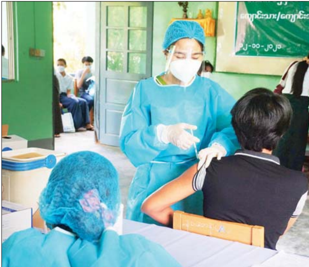
ဇမ္ဗူသီရိမြို့နယ်တွင် ကျောင်းသားတစ်ဦးကို ကိုဗစ်-၁၉ ရောဂါ ကာကွယ်ဆေးထိုးနှံပေးစဉ်။