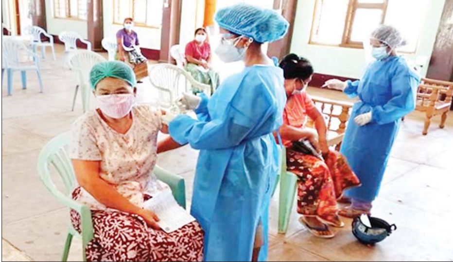
မြို့၌ ၂၃၁၁ ဦး၊ ရှမ်းပြည်နယ် လေးမြို့နယ်၌ ၁၄၂၃ ဦး၊ မွန် အတွင်းရှိမြို့နယ် ၁၄ မြို့နယ်တို့၌ ၁၄၁၂၃ ဦး၊ တနင်္သာရီတိုင်းဒေသ

နေပြည်တော် အောက်တိုဘာ ၁၄ ကိုဗစ်-၁၉ ရောဂါ ကာကွယ် ဆေးထိုးနှံမှုကို တိုင်းဒေသကြီး နှင့် ပြည်နယ်အသီးသီးတို့၌ တပ်မတော်မှ ဆေးအဖွဲ့များ၊ ပြည်သူ့ဆေးရုံများမှ ဆရာဝန် များ၊ သူနာပြုများ၊ ကျန်းမာရေး ဝန်ထမ်းများနှင့် စေတနာ့ဝန်ထမ်း များက ကာကွယ်ဆေးထိုးခြင်း လုပ်ငန်းများကို ဆောင်ရွက်ပေး လျက်ရှိသည်။ (ယာပုံ) ထိုသို့ ဆောင်ရွက်လျက်ရှိရာ ယနေ့တွင် နေပြည်တော်ကောင်စီ နယ်မြေ ပျဉ်းမနားမြို့နယ်၌ ၂၅ ဦး၊ ကချင်ပြည်နယ် မြစ်ကြီးနား