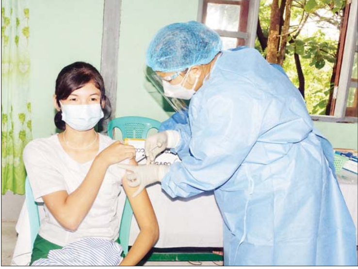
ပြည်ထောင်စုနယ်မြေ၊ နေပြည်တော် ဒက္ခိဏသီရိမြို့နယ် အမှတ်(၁၈) အခြေခံပညာအထက်တန်းကျောင်း ဆေးထိုးစုရပ်၌ အောက်တိုဘာ ၁၂ ရက်က ကိုဗစ်-၁၉ ရောဂါကာကွယ်ဆေး ပထမအကြိမ်အဖြစ် ကျောင်းသူတစ်ဦးအား ထိုးနှံပေးစဉ်။