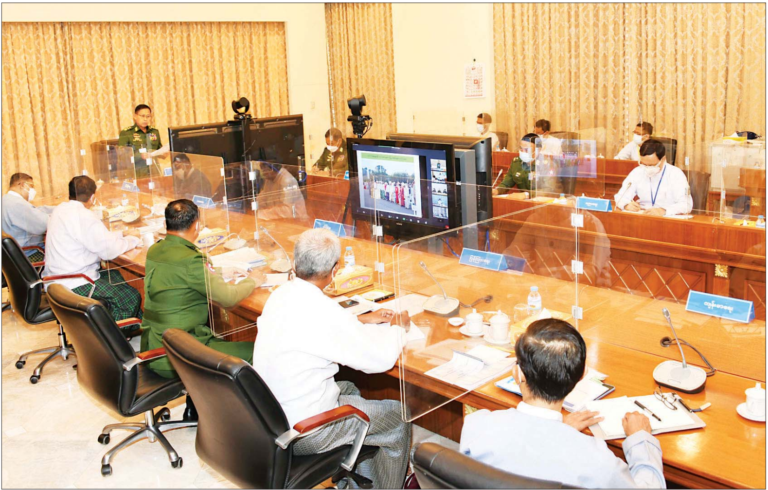
နိုင်ငံတော်စီမံအုပ်ချုပ်ရေးကောင်စီ ဒုတိယဥက္ကဋ္ဌ၊ ဒုတိယဝန်ကြီးချုပ် ဒုတိယဗိုလ်ချုပ်မှူးကြီး စိုးဝင်း (၇၄)နှစ်မြောက် လွတ်လပ်ရေးနေ့ကျင်းပရေး ဗဟိုကော်မတီ ပထမအကြိမ် ညှိနှိုင်းအစည်းအဝေးတွင် အမှာစကားပြောကြားစဉ်။

နေပြည်တော် အောက်တိုဘာ ၁၂ ၂၀၂၂ ခုနှစ်၊ (၇၄)နှစ်မြောက် လွတ်လပ်ရေးနေ့ ကျင်းပရေး ဗဟိုကော်မတီ ပထမအကြိမ် ညှိနှိုင်းအစည်းအဝေးကို ယနေ့ ညနေပိုင်းတွင် နေပြည်တော်ရှိ နိုင်ငံတော် စီမံအုပ်ချုပ်ရေးကောင်စီဥက္ကဋ္ဌရုံး အစည်းအဝေးခန်းမ၌ကျင်းပရာ (၇၄)နှစ်မြောက် လွတ်လပ်ရေးနေ့ ကျင်းပရေး ဗဟိုကော်မတီဥက္ကဋ္ဌ၊ နိုင်ငံတော် စီမံအုပ်ချုပ်ရေးကောင်စီ ဒုတိယဥက္ကဋ္ဌ၊ ဒုတိယဝန်ကြီးချုပ် ဒုတိယဗိုလ်ချုပ်မှူးကြီး စိုးဝင်း တက်ရောက် အမှာစကားပြောကြားသည်။ အစည်းအဝေးသို့ ပြည်ထောင်စုဝန်ကြီးများ ဖြစ်ကြသည့် ဦးဝဏ္ဏမောင်လွင်၊ ဒုတိယဗိုလ်ချုပ်ကြီး ရာပြည့်၊ ဦးမင်းသိန်း၊ နေပြည်တော်ကောင်စီဥက္ကဋ္ဌ ဒေါက်တာမောင်မောင်နိုင်၊ နေပြည်တော်တိုင်း စစ်ဌာနချုပ်တိုင်းမှူး ဗိုလ်ချုပ်ဇော်ဟိန်းနှင့် တာဝန်ရှိဖွဲ့ကြားထားသူများက စာမျက်နှာ ၃ ကော်လံ ၁ ❖