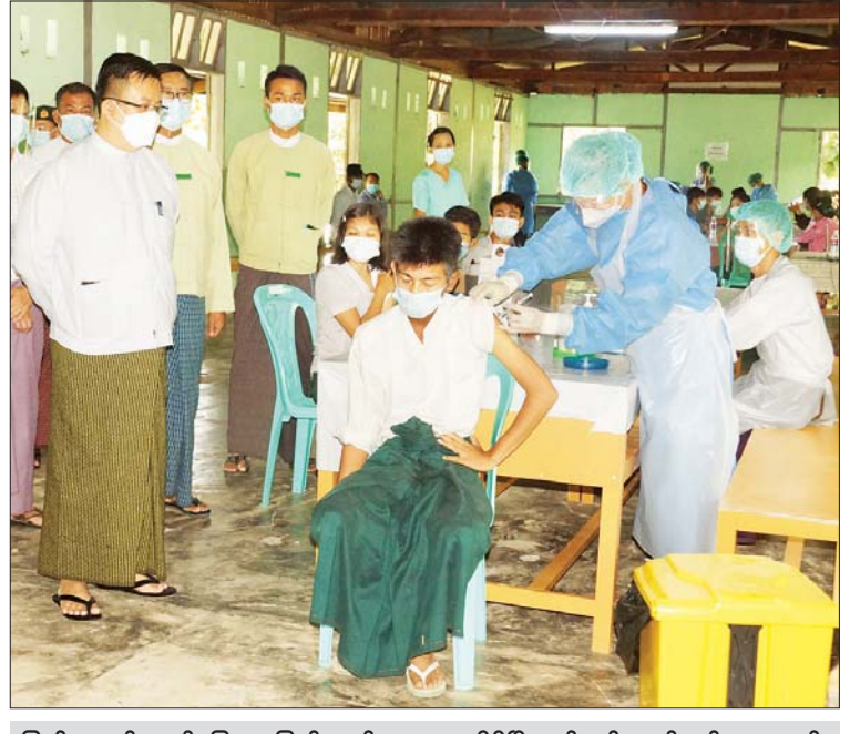
ပြည်ထောင်စုနယ်မြေ၊ နေပြည်တော် ဇေယျာသီရိမြို့နယ်တွင် သတ်မှတ်ထားသည့် ဆေးထိုးစုရပ်များ၌ အောက်တိုဘာ ၁၂ ရက်က အသက် (၁၂)နှစ်အထက် ကျောင်းသား ကျောင်းသူများအား ကိုဗစ်-၁၉ ကာကွယ်ဆေးထိုးနှံပေးရာ နေပြည်တော်ကောင်စီအဖွဲ့ဝင် ဦးဇေယျာလင်းနှင့် တာဝန်ရှိသူများ ကြည့်ရှုအားပေးစဉ်။ မြို့နယ်(ပြန်/ဆက်)