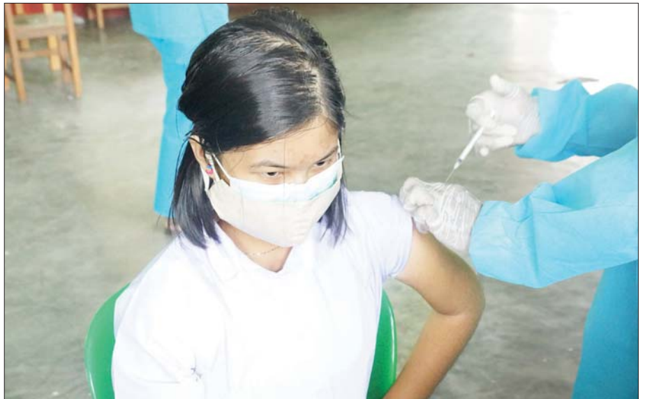
ပြည်ထောင်စုနယ်မြေ၊ နေပြည်တော် ပုဗ္ဗသီရိမြို့နယ် အမှတ်(၂၀) အခြေခံပညာအထက်တန်းကျောင်း၌ အောက်တိုဘာ ၁၂ ရက်က အသက်(၁၂)နှစ်အထက် ကျောင်းသူတစ်ဦးအား ကိုဗစ်-၁၉ ကာကွယ်ဆေးထိုးနှံပေးစဉ်။ မျိုးသီဟ(ပြန်/ဆက်)