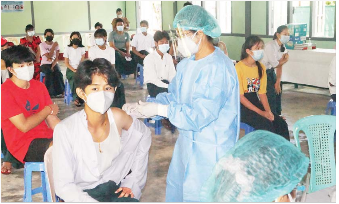
ပြည်ထောင်စုနယ်မြေ၊ နေပြည်တော် လယ်ဝေးမြို့နယ် အမှတ်(၁) အခြေခံပညာအထက်တန်းကျောင်း၌ အောက်တိုဘာ ၁၂ ရက်က အသက်(၁၂)နှစ်အထက် ကျောင်းသားကျောင်းသူများအား ကိုဗစ်-၁၉ရောဂါ ကာကွယ်ဆေးထိုးနှံပေးစဉ်။ နေဇော်ချစ် (ပြန်/ဆက်)