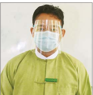
ဦးနေမျိုးထွန်း

ဆေးထိုးခြင်းရည်ရွယ်ချက်ကတော့ ကျောင်းသား ကျောင်းသူတွေဆိုတာ လူအစုလိုက် တစ်နေရာတည်းမှာတက်နေတဲ့ အုပ်စုတွေဖြစ်ကြပါတယ်။ ဒါကြောင့် တစ်ယောက်နဲ့တစ်ယောက်ကူးစက်မှုမြန်နိုင်ပါတယ်။ ဆေးထိုးလိုက်ခြင်းအားဖြင့် ကျောင်းသား ကျောင်းသူတွေ အချင်းချင်း ကူးစက်မှု လျော့ကျသွားနိုင်တာပေါ့။ နောက်တစ်ခါ ကျောင်းသားကျောင်းသူတွေကနေ အိမ်ကမိသားစုဝင်တွေကို ကူးစက်နိုင်မှု လျော့ကျသွားနိုင်တာပေါ့။ ဒီလိုလျော့ကျသွားရင် ကျောင်းတွေပြန်ဖွင့်ပြီး ကလေးတွေဟာ မူလအတိုင်း ပညာသင်ကြားနိုင်ဖို့အတွက် ရည်ရွယ်ပြီး ဆေးထိုးနှံပေးတာဖြစ်ပါတယ်။ ဒီဆေးထိုးဖို့အတွက် နိုင်ငံတော်စီမံအုပ်ချုပ်ရေးကောင်စီရဲ့လမ်းညွှန်ချက်အရ ကျန်းမာရေးဝန်ကြီးဌာနအနေနဲ့ ဆေးတွေရရှိဖို့ကြိုးစားပြီး ကျောင်းသား