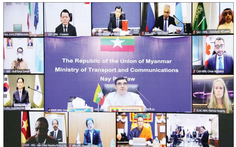
High Level Conference on COVID-19 (HLCC 2021) ကို အောက်တိုဘာ ၁၂ ရက်မှ ၂၂ ရက်အထိ Ministerial Plenary အစည်းအဝေး၊ ဘေးကင်းလုံခြုံရေး (Safety) ကဏ္ဍဆိုင်ရာအစည်းအဝေးနှင့် လွယ်ကူချောမွေ့စေရေး (Facilitation) ကဏ္ဍဆိုင်ရာအစည်းအဝေးများကို ကျင်းပသွားမည်ဖြစ်ကြောင်း သိရသည်။ သတင်းစဉ်

နိုင်ရေးအတွက် ယခုအစည်းအဝေးကျင်းပခြင်းဖြစ်ကြောင်း ပြောကြားသည်။ ဒုတိယဝန်ကြီးက နိုင်ငံတစ်ဝန်း ကိုဗစ်-၁၉ ကပ်ရောဂါဖြစ်ပွားမှုအခြေအနေများ၊ နိုင်ငံတော်အစိုးရက ရှေ့လုပ်ငန်းစဉ် (၅) ရပ်၊ ဦးတည်ချက် (၉) ရပ် ချမှတ်ဆောင်ရွက်နေမှု၊ ရှေ့လုပ်ငန်းစဉ် (၅) ရပ်တွင် ကိုဗစ်-၁၉ ကာကွယ်ရေးလုပ်ငန်းကို အရှိန်အဟုန်မပြတ် ထိထိရောက်ရောက် ဆက်လက်ဆောင်ရွက်ရေးနှင့် ကိုဗစ်-၁၉ ကပ်ရောဂါကြောင့် ထိခိုက်ခဲ့သည့်စီးပွားရေးလုပ်ငန်းများအား ဖြစ်နိုင်သမျှ နည်းလမ်းများဖြင့် အမြန်ဆုံးကုစားရေး ဟူသည့် လုပ်ငန်းစဉ် (၂) ရပ်ဆောင်ရွက်နေမှု၊ မြန်မာနိုင်ငံ၏ လေကြောင်းပို့ဆောင်ရေးကဏ္ဍ ထိခိုက်ခံစားရမှုများ၊ လေကြောင်းပို့ဆောင်ရေးသည် ပြည်ပရင်းနှီးမြှုပ်နှံမှုများတိုးတက်ရေး၊ ကမ္ဘာလှည့်ခရီးသွားလုပ်ငန်းများ ဖြင့်တင်ရေးနှင့် စီးပွားရေးအခွင့်အလမ်းများ ဖြစ်ထွန်းရေးအတွက် အရေးပါသည့်အလျောက် မြန်မာနိုင်ငံ၏စီးပွားရေး ပြန်လည်ဦးမော့လာစေရေး စီမံချက် (Myanmar Economic Relief Plan-MERP) နှင့်အညီ လေကြောင်းပို့ဆောင်ရေးကဏ္ဍ ပြန်လည်ဦးမော့စေရေး ဆောင်ရွက်နေမှုများ၊ အပြည်ပြည်ဆိုင်ရာမြို့ပြလေကြောင်းအဖွဲ့ချုပ်က ထုတ်ပြန်သည့် လမ်းညွှန်ချက်များနှင့်အညီ လေဆိပ်လုပ်ငန်း