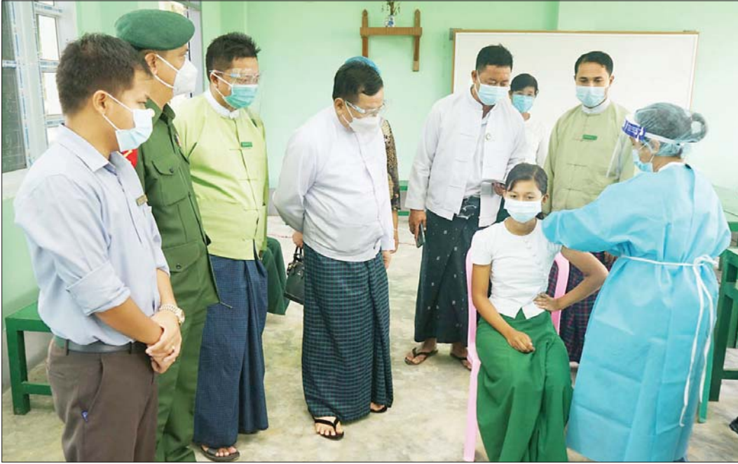
ပြည်ထောင်စုနယ်မြေ၊ နေပြည်တော် ဥတ္တရသီရိမြို့နယ်အတွင်းရှိ အသက်(၁၂)နှစ်နှင့်အထက် ကျောင်းသား ကျောင်းသူများအား ကိုဗစ်-၁၉ရောဂါကာကွယ်ဆေး ပထမအကြိမ်ထိုးနှံပေးခြင်းကို သတ်မှတ်ထားသည့် ဆေးထိုးစုရပ်များ၌ အောက်တိုဘာ ၁၂ ရက်က ဆောင်ရွက်ရာ နေပြည်တော်ကောင်စီအဖွဲ့ဝင် ဦးမြင့်စိုး နှင့်တာဝန်ရှိသူများ ကြည့်ရှုအားပေးစဉ်။