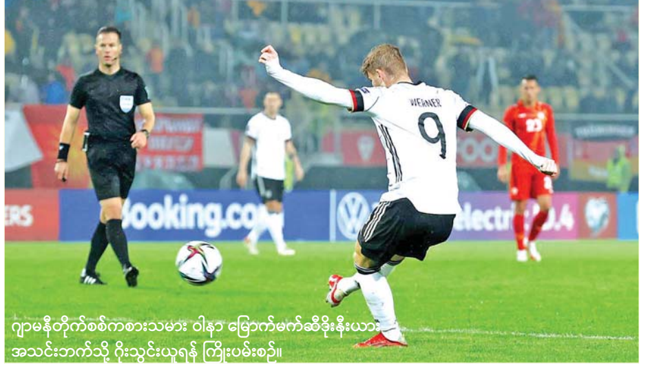
ဂျာမနီတိုက်စစ်ကစားသမား ဝါနာ မြောက်မက်ဆီဒိုးနီးယား အသင်းဘက်သို့ ဂိုးသွင်းယူရန် ကြိုးပမ်းစဉ်။

ဂျာမနီအသင်းသည် အားထားရ သည့် ဝါနာ၊ မူလာ၊ ဟာဗက်စ်၊ ဂနာဘာရီအပါအဝင် ကစားသမား အစုံအလင်ဖြင့် မြောက်မက်ဆီ ဒိုးနီးယားအသင်းကို ရင်ဆိုင်လာ ခဲ့သည်။ မြောက်မက်ဆီဒိုးနီးယား အသင်းကလည်း ဂျဟိုဗစ်၊ အဲလ် မက်စ်၊ ချူလင်နေ့ဗစ်စသည့် အဓိက ကစားသမားအစုံအလင် ဖြင့် စာမျက်နှာ ၁၃ ကော်လံ ၁ မှ