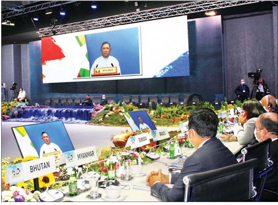
ပြည်ထောင်စုဝန်ကြီး ဦးဝဏ္ဏမောင်လွင် ဆားဘီးယားနိုင်ငံ ဘဲလ်ဂရီမြို့၌ ကျင်းပသည့် ဘက်မလိုက်လှုပ်ရှားမှုအဖွဲ့၏ နှစ်(၆၀)ပြည့် အထိမ်းအမှတ် အဆင့်မြင့်အစည်းအဝေးတွင် ဗီဒီယိုဖြင့် မိန့်ခွန်းပြောကြားစဉ်။

ပြည်ထောင်စုဝန်ကြီးက ဘက်မလိုက်လှုပ်ရှားမှုအဖွဲ့သည် နိုင်ငံတစ်ခုတည်းတည်းဖြင့် သီးခြားရပ်တည်နိုင်သည့် အဖွဲ့အစည်းတစ်ခုဖြစ်သည်နှင့်အညီ နိုင်ငံအချင်းချင်းအကြား နားလည်မှုရှိမှုနှင့် လေးစားမှု၊ ဘက်မလိုက်မှုနှင့် နိုင်ငံရေးပယောဂကင်းရှင်းစေရန် စသည့်အခြေခံမူများကို ဆက်လက်ကျင့်သုံးရမည်ဖြစ်ကြောင်း၊ မိမိတို့၏ ဘုံအကျိုးစီးပွားကာကွယ်ရန်နှင့် ဘုံစိန်ခေါ်မှု အခက်အခဲများကို တုံ့ပြန်ဖြေရှင်းရန်အတွက် မြန်မာနိုင်ငံအနေဖြင့် ဘက်မလိုက်လှုပ်ရှားမှုအဖွဲ့ဝင်များနှင့် စည်းလုံးညီညွတ်စွာ လက်တွဲဆောင်ရွက်သွားမည်ဖြစ်ကြောင်း၊ မြန်မာနိုင်ငံအတွင်း ငြိမ်းချမ်းရေး၊ ဒီမိုကရေစီနှင့် ဖွံ့ဖြိုးတိုးတက်မှုဖော်ဆောင်ရန် ကြိုးပမ်းအားထုတ်နေသည့်အချိန်တွင် ဘက်မလိုက်လှုပ်ရှားမှုအဖွဲ့ဝင်များ၏ ထောက်ခံမှု၊ နားလည်မှုနှင့် အပြုသဘောဆောင်သည့် ပူးပေါင်းဆောင်ရွက်မှုကို