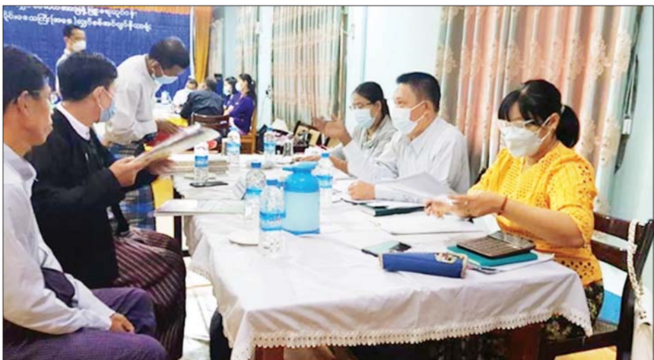
ပြည်ထောင်စုရွေးကောက်ပွဲကော်မရှင်က ပြည်ထောင်စုလယ်သမား အလုပ်သမား အင်အားစုပါတီအား သွားရောက်စစ်ဆေးစဉ်။

လယ်သမား အလုပ်သမား အင်အားစုပါတီနှင့် မြန်မာနိုင်ငံ အလုပ်သမား လယ်သမား မဟာမိတ်ပါတီ [Alliance of Myanmar's Worker and Farmer Party (A.M.W.F.P)] တို့ကို ၄.၁၀.၂၀၂၁ ရက်နေ့မှ ၈.၁၀.၂၀၂၁ ရက်နေ့အထိလည်းကောင်း၊ ရန်ကုန်တိုင်းဒေသကြီးအခြေစိုက်ဖြစ်ကြသော အမျိုးသားညီညွတ်ရေးကွန်ဂရက်ပါတီ၊ ဒီမိုကရေစီနှင့် လူ့အခွင့်အရေးပါတီ၊ ညီညွတ်သောတိုင်းရင်းသားလူမျိုးများ ဒီမိုကရေစီပါတီတို့ကို ၄.၁၀.၂၀၂၁ ရက်နေ့မှ ၈.၁၀.၂၀၂၁ ရက်နေ့အထိ လည်းကောင်း၊ ရှမ်းပြည်နယ်အခြေစိုက်ဖြစ်သော ရှမ်းတိုင်းရင်းသားများ ဒီမိုကရက်တစ်ပါတီကို ၄.၁၀.၂၀၂၁ ရက်နေ့မှ ၈.၁၀.၂၀၂၁ ရက်နေ့အထိလည်းကောင်း၊ ဧရာဝတီတိုင်းဒေသကြီးအခြေစိုက်ဖြစ်သော မြန်မာနိုင်ငံ တောင်သူလယ်သမား အလုပ်သမားပြည်သူ့ပါတီကို ၄.၁၀.၂၀၂၁ ရက်နေ့မှ ၆.၁၀.၂၀၂၁ ရက်နေ့အထိလည်းကောင်း၊ ကရင်ပြည်နယ် အခြေစိုက်ဖြစ်ကြသော ဗလုံ - စဝေါ် ဒီမိုကရက်တစ်ပါတီနှင့် ကရင်အမျိုးသားဒီမိုကရက်တစ်ပါတီ (Karen National Democratic Party) တို့ကို ၅.၁၀.၂၀၂၁ ရက်နေ့မှ