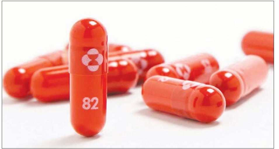
ဖိုက်ဇာနှင့် ဆွစ်ဇာလန် ဆေးဝါးကုမ္ပဏီဖြစ်သည့် ရိုချီ တို့သည် ကိုဗစ်-၁၉ ဆေးတောင့်များ ထုတ်လုပ် ရန်အတွက် စမ်းသပ်မှုများပြုလုပ်နေကြသည်။ အင်န်အိတ်ချီကေ