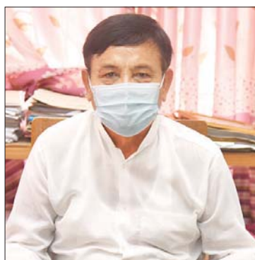
ဦးအောင်လွင်