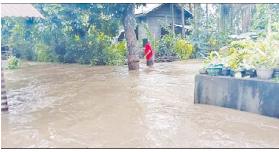
ဖိလစ်ပိုင်နိုင်ငံတွင် အပူပိုင်းမုန်တိုင်းကြောင့် ရေကြီးမှုကို တွေ့ရစဉ်။

ခဲ့သည်။ လမ်းများ၊ တံတားများ ပျက်စီးခဲ့ရသည်။ လူဇန်ကျွန်းရှိ လူပေါင်း ၁၆၀၀ မှာလည်း ဘေးလွတ်ရာသို့ ရွှေ့ပြောင်းခဲ့ရ သည်။ ဖိလစ်ပိုင်မြောက်ပိုင်းဒေသ တွင် မိုးသည်းထန်စွာ ရွာသွန်းပြီး ရေကြီးမှုနှင့် မြေပြိုမှုများဖြစ်ပေါ် လာနိုင်သည်ဟုလည်း ဖိလစ်ပိုင် လေထု၊ မိုးလေဝသနှင့် နက္ခတ္တ ဗေဒ ဝန်ဆောင်မှုစီမံခန့်ခွဲမှုက သတိပေးထားသည်။