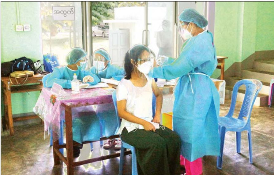
ပြည်ထောင်စုနယ်မြေ၊ နေပြည်တော် ဧမ္မာသီရိမြို့နယ်တွင် အောက်တိုဘာ ၁၂ ရက်က အသက်(၁၂)နှစ်အထက် ကျောင်းသူတစ်ဦးအား ကိုဗစ်-၁၉ ကာကွယ်ဆေးထိုးနှံပေးစဉ်။ မြို့နယ်(ပြန်/ဆက်)