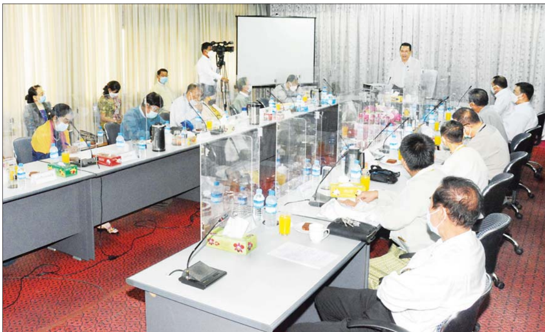
ပြည်ထောင်စုဝန်ကြီး ဦးမောင်မောင်အုန်း မြန်မာနိုင်ငံဂီတအစည်းအရုံး(ဗဟို) ယာယီအမှုဆောင် အဖွဲ့ဝင်များနှင့် တွေ့ဆုံဆွေးနွေးစဉ်။

ရန်ကုန် အောက်တိုဘာ ၁၂ ပြန်ကြားရေးဝန်ကြီးဌာန ပြည်ထောင်စုဝန်ကြီး ဦးမောင်မောင်အုန်းသည် မြန်မာနိုင်ငံဂီတအစည်းအရုံး(ဗဟို) ယာယီအမှုဆောင်အဖွဲ့ဝင်များနှင့် ယနေ့နံနက်ပိုင်းတွင် ရန်ကုန်မြို့၊ ပြည်လမ်းရှိ မြန်မာ့အသံနှင့် ရုပ်မြင်သံကြား၌ တွေ့ဆုံပြီး ဂီတလောက ဖွံ့ဖြိုးတိုးတက်ရေးအတွက် ဆွေးနွေးခဲ့သည်။