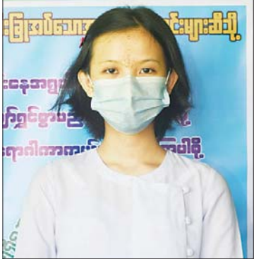
မယွန်းနဒီ