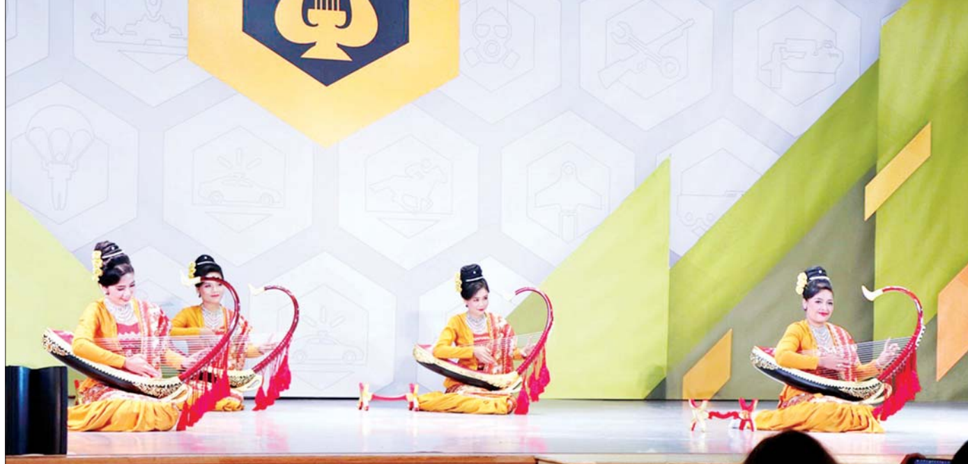
ရုရှားဖက်ဒရေရှင်းနိုင်ငံ၌ ဩဂုတ် ၂၂ ရက်မှ စက်တင်ဘာ ၄ ရက်အထိ ကျင်းပခဲ့သည့် International Army Games-2021 ပြိုင်ပွဲ၏ ဆက်စပ်ပြိုင်ပွဲတစ်ရပ် ဖြစ်သည့် Creative Competition ပြိုင်ပွဲတွင် မြန်မာ့တပ်မတော်မှ မြန်မာ့ရိုးရာ ယဉ်ကျေးမှုအဖွဲ့ မြန်မာ့စောင်း၏ ယိမ်းအလှအကဖြင့် ပြိုင်ပွဲဝင်နေစဉ်။

အခြေခံပညာနှင့် အဆင့်မြင့်ပညာ တက္ကသိုလ်များ၊ ကောလိပ်များနှင့် သင်တန်းကျောင်းများကို ကိုဗစ်-၁၉ ကာကွယ်ရေးနည်းလမ်းများနှင့်အညီ အမြန်ဆုံးပြန်လည်ဖွင့်လှစ်နိုင်ရေးအတွက် ပညာရေးဝန်ကြီးဌာနမှ ကြိုးပမ်းလျက်ရှိသည်ကိုလည်း စက်တင်ဘာ ၆ ရက်က မြင်တွေ့ရသည်။ ထို့အတူ အခြေခံပညာစာသင်ကျောင်းများရှိ လက်တွေ့ခန်းများတွင် စနစ်တကျ သင်ယူမှုပြုနိုင်ရေး၊ စာကြည့်တိုက်နှင့် ကျောင်းသုံးပရိဘောဂများ ဖြည့်ဆည်းပေးရေး၊ ကျောင်းအားကစားရုံအပါအဝင် ကျန်းမာကြံ့ခိုင်ရေးအတွက် စီစဉ်ထားရှိရန်များကိုလည်း ပညာရေးဝန်ကြီးဌာန ပြည်ထောင်စုဝန်ကြီးက လမ်းညွှန်မှာကြားပေးသည်ကိုလည်း မြင်တွေ့ရသည်။ (ဆက်လက်ဖော်ပြပါမည်)