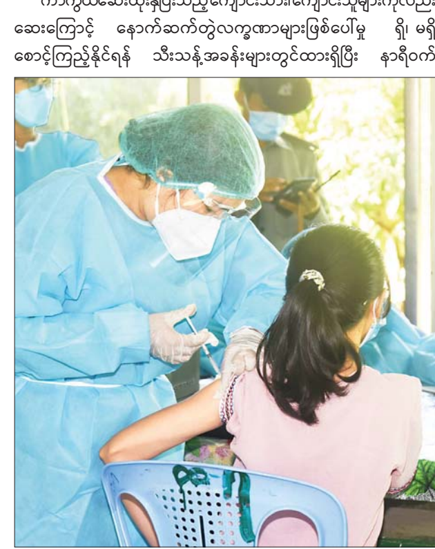
ကျောင်းသူတစ်ဦးအား ကိုဗစ်-၁၉ ကာကွယ်ဆေးထိုးနှံပေးစဉ်။

အသက် ၁၂ နှစ်နှင့်အထက် ကျောင်းသား၊ ကျောင်းသူများနှင့် ၎င်းတို့၏ မိဘအုပ်ထိန်းသူများအား ကြိုတင်အသိပညာပေးခြင်းများ ဆောင်ရွက်ပြီး မိဘအုပ်ထိန်းသူများ၏ သဘောတူညီချက်လက်မှတ်ရယူကာ ကာကွယ်ဆေးထိုးနှံပေးသည်။ ကာကွယ်ဆေးထိုးနှံပြီးသည့်ကျောင်းသား၊ ကျောင်းသူများကိုလည်း ဆေးကြောင့် နောက်ဆက်တွဲလက္ခဏာများဖြစ်ပေါ်မှု ရှိ၊ မရှိ စောင့်ကြည့်နိုင်ရန် သီးသန့်အခန်းများတွင်ထားရှိပြီး နာရီဝက်