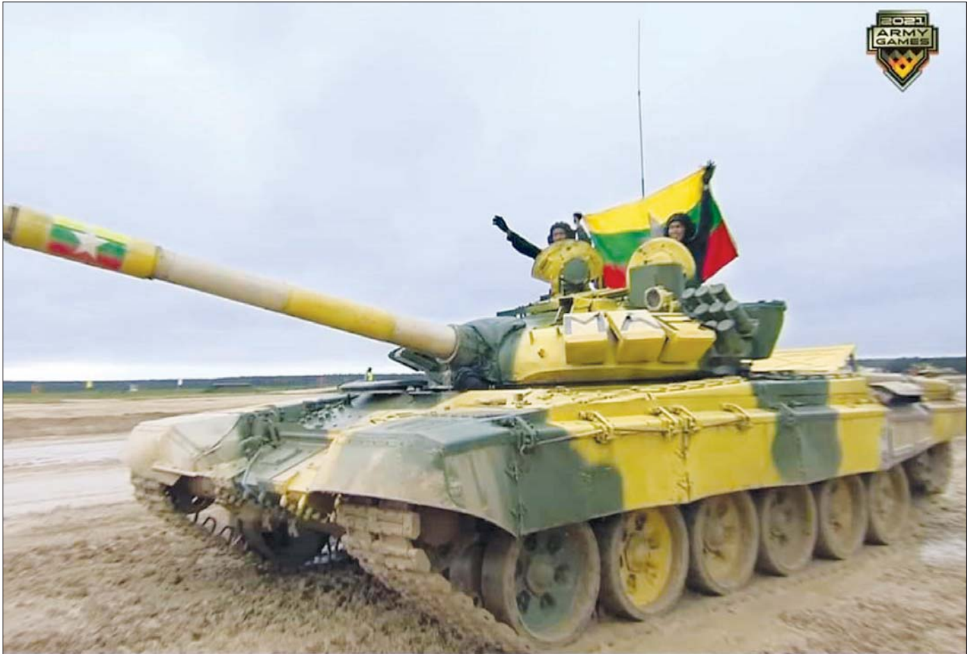
စက်တင်ဘာ ၃ ရက်က ရုရှားဖက်ဒရေးရှင်းနိုင်ငံ၌ ကျင်းပသည့် International Army Games-2021 တင့်ကားမောင်းနှင်ပစ်ခတ်ခြင်းပြိုင်ပွဲ Tank Biathlon (Division-2) ပြိုင်ပွဲတွင် မြန်မာ့တပ်မတော် တင့်တပ်ဖွဲ့ ပန်းဝင်လာစဉ်။

စက်တင်ဘာ ၃၀ ရက်က ဒုတိယဝန်ကြီးချုပ် ဒုတိယဗိုလ်ချုပ်မှူးကြီး စိုးဝင်းသည် ပညာရေးဝန်ကြီးဌာန၊ အခြေခံပညာဦးစီးဌာန၊ အလယ်တန်း၊ အထက်တန်းအသက် ၁၂ နှစ်နှင့်အထက် ကျောင်းသား၊ ကျောင်းသူများအား ကိုဗစ်-၁၉ ကူးစက်မြန်