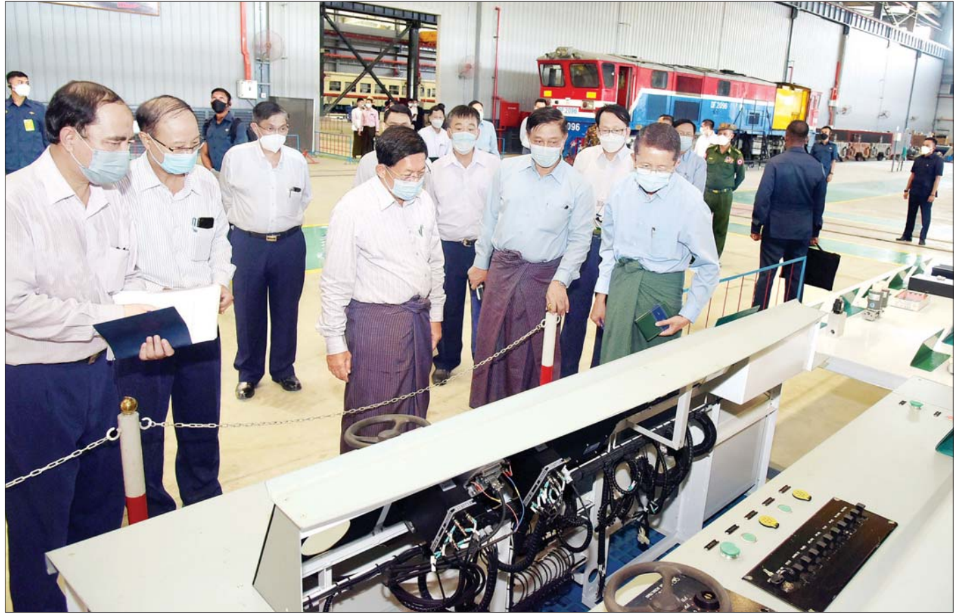
နိုင်ငံတော်စီမံအုပ်ချုပ်ရေးကောင်စီဥက္ကဋ္ဌ၊ နိုင်ငံတော်ဝန်ကြီးချုပ် ဗိုလ်ချုပ်မှူးကြီးမင်းအောင်လှိုင် စက်တင်ဘာ ၁၀ ရက်က မြန်မာ့မီးရထားစက်မှုနှင့် လျှပ်စစ်အင်ဂျင်နီယာဌာန စက်ခေါင်းသစ် တပ်ဆင်ထုတ်လုပ်ရေးစက်ရုံ (နေပြည်တော်)တွင် ကြည့်ရှုစစ်ဆေးစဉ်။

ရေးသည်လည်း အရေးကြီးကြောင်း စသည်ဖြင့် ထည့်သွင်းပြောကြားခဲ့သည့်အပြင် ပြည်ပဝင်ငွေ တိုးမြှင့်ရရှိစေမည့် စိုက်ပျိုးမွေးမြူရေးကဏ္ဍကို မြှင့်တင်ခြင်းဖြင့် ပြည်ပပို့ကုန်များ၊ ပြည်တွင်း စားသောက်ရိက္ခာဖူလုံစေရေးအတွက် လမ်းညွှန်