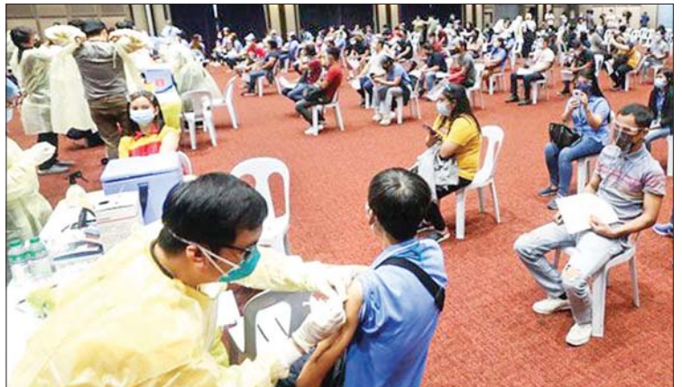
ဖိလစ်ပိုင်နိုင်ငံတွင် ကိုဗစ်-၁၉ ကာကွယ်ဆေးထိုးနေကြသည်ကို တွေ့ရစဉ်။

၁၁ ရက်က ကိုဗစ်-၁၉ ထပ်မံကူးစက်သူ ၈၂၉ ဦး တိုးလာပြီးနောက် နိုင်ငံအတွင်း