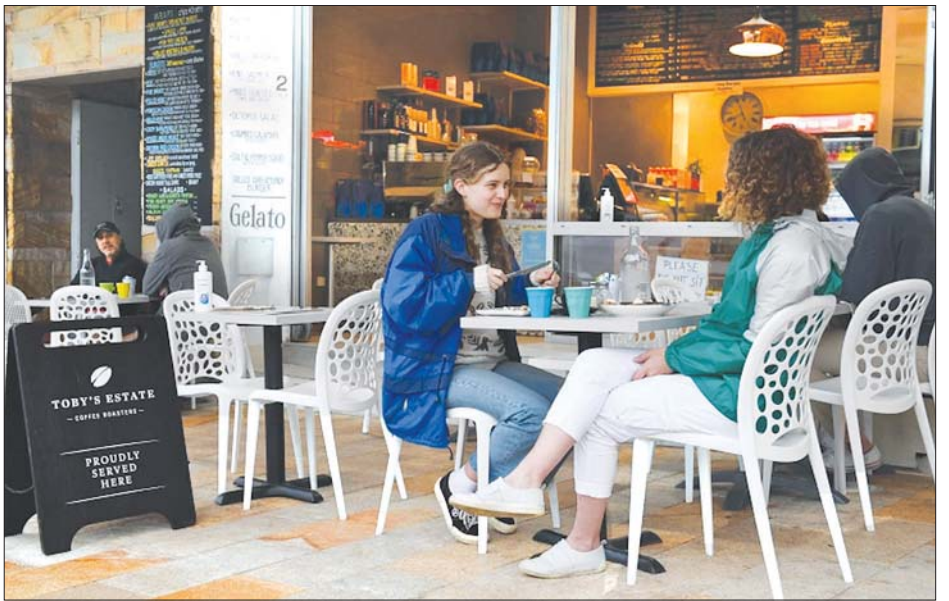
ဆစ်ဒနီမြို့တွင် ကာကွယ်ဆေးထိုးပြီးသူများအတွက် ဖြေလျှော့ပေးလိုက်ပြီးနောက် ဆိုင်ထိုင်စားသောက် နေကြသူများကို တွေ့ရစဉ်။

သည် ပျော်ရွှင်စွာ လာရောက်စားသောက်နေကြသည် ကို တွေ့ရသည်။ လာရောက်စားသောက်သည့် အမျိုးသမီးတစ်ဦးက ၎င်းအနေဖြင့် စည်းကမ်းများကို လိုက်နာသွားမည်ဖြစ်ကြောင်းနှင့် လူမှုဝေးကွာ အစီအစဉ်များနှင့် ပါးစပ်၊ နှာခေါင်းစည်း ဝတ်ဆင် ခြင်းများကိုလည်း ဆက်လက်ပြုလုပ်သွားမည်ဟု ပြောသည်။ အကယ်၍ လူပေါင်းများစွာ ကာကွယ် ဆေးထိုးပြီးပါက နောက်ထပ်အသွားအလာပိတ်ဆို့ ကန့်သတ်ခံရမှုနှင့် မကြုံတွေ့နိုင်တော့ဟု ကော်ဖီဆိုင် ပိုင်ရှင်ကပြောသည်။ ယနေ့မှာ လူပေါင်းများစွာ မျှော်လင့်နေသည့်နေ့ ဖြစ်ကြောင်း သြစတြေးလျဝန်ကြီးချုပ် စကော့က မော်ရစ်ဆင်က ပြောသည်။ ကာကွယ်ဆေးထိုးပေး သည့်အစီအစဉ်ကို ပြည်သူများ လိုက်နာကြရန် တိုက်တွန်းခဲ့ပြီး ကာကွယ်ဆေးထိုးခြင်းဖြင့် အသွား အလာပိတ်ဆို့ကန့်သတ်ခံရမှုမှ ကင်းလွတ်မည်ဟု လည်း ၎င်းက ဆက်ပြောသည်။ အင်န်အိတ်ချ်ကေ