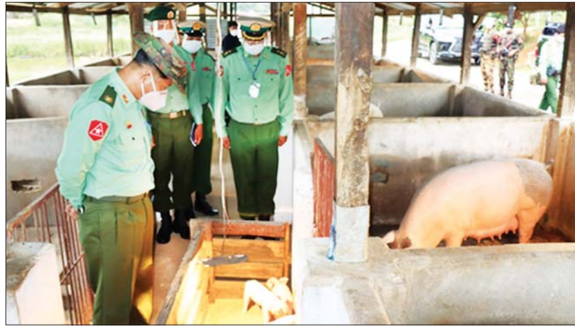
များနှင့် တွေ့ဆုံကာ ကုန်ထုတ်လုပ်မှု လုပ်ငန်း သည်များ ပေါင်းစပ်ညှိနှိုင်း ဆောင်ရွက်ပေး များ ရာနှုန်းပြည့်ဆောင်ရွက်နိုင်ရေးနှင့် လိုအပ် ကြောင်း သတင်းရရှိသည်။ သတင်းစဉ်

နေပြည်တော် အောက်တိုဘာ ၁၁ ကိုဗစ်-၁၉ ရောဂါ တတ်ယလှိုင်း ဖြစ်ပွားမှု ကြောင့် ရောဂါကာကွယ်၊ ထိန်းချုပ်၊ ကုသရေး လုပ်ငန်းများ ဆောင်ရွက်နေချိန်တွင် ဒေသ တွင်း စားနပ်ရိက္ခာဖူလုံရေးနှင့် ပြည်သူ များ၏ စားသောက်ရေးကို အထောက်အကူ ဖြစ်စေရန်အတွက် ယနေ့တွင် ကြိုဂဒေသ တိုင်းစစ်ဌာနချုပ် တိုင်းမှူး ဗိုလ်မှူးချုပ် မျိုးမင်းထွန်းနှင့် အဖွဲ့ဝင်များသည် ရှမ်းပြည် နယ် အရှေ့ပိုင်း ကျိုင်းတုံတပ်နယ်ရှိ တပ်ရင်း/တပ်ဖွဲ့များ၏ စိုက်ပျိုးရေးလုပ်ငန်း၊ မွေးမြူရေးလုပ်ငန်းများကို သွားရောက် ကြည့်ရှုသည်။ (ယာပုံ) ယင်းနောက် တိုင်းမှူးသည် တာဝန်ရှိသူ များနှင့် တွေ့ဆုံကာ ကုန်ထုတ်လုပ်မှု လုပ်ငန်း သည်များ ပေါင်းစပ်ညှိနှိုင်း ဆောင်ရွက်ပေး များ ရာနှုန်းပြည့်ဆောင်ရွက်နိုင်ရေးနှင့် လိုအပ် ကြောင်း သတင်းရရှိသည်။ သတင်းစဉ်