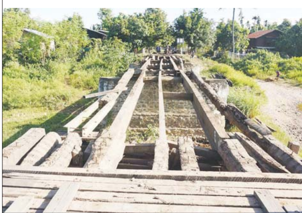
အထောက်အကူပြုသော တံတား ဖြစ်သည့်အပြင် ခရိုင်ချင်းဆက် အမှတ်(၃) လမ်းမကြီးနှင့် ဆက်သွယ်ထားသော လမ်းပေါ်ရှိ တံတားတစ်ခု ဖြစ်သည့် အားလျော်စွာ ထီးချိုင့် မြို့နယ်အတွင်းမှ လာရောက် သည့် ပြည်သူများအတွက်ပါ များစွာ အထောက်အကူပြုသော တံတားဖြစ်ကြောင်း သိရသည်။ ခရိုင်(ပြန်/ဆက်)

၆ သန်းကို အဆိုပါတံတား ပြန်လည်ပြုပြင်နိုင်ရေးအတွက် ခွင့်ပြုခဲ့ကြောင်း၊ တံတား ပြန်လည် ပြုပြင်ခွင့်ပြုသည့်နေ့ မှစတင်၍ တံတားပြန်လည် ပြုပြင်ရေးလုပ်ငန်းအဖွဲ့ ဖွဲ့စည်း တာဝန်ပေးအပ်ကာ တံတား ပြန်လည်ပြုပြင်ခြင်း လုပ်ငန်းများ ကို ဆောင်ရွက်လျက်ရှိပါသည်။ ကသာ- ပြည်သာယာ- သိမ်အင်း ကတ္တရာလမ်းမပေါ်ရှိ သွေးကျောက်ချောင်းသစ်သား တံတားသည် စုစုပေါင်းအလျား အနံ(၂၂၄ x ၁၄)ပေနှင့် ပေ ၄၀ ခန့် နှစ်ခန်း၊ ၂၄ ပေခန်း နှစ်ခန်း တို့ကို ပြန်လည်ပြုပြင်နိုင်ရန် အတွက် တိုင်းဒေသကြီးအစိုးရ အဖွဲ့၏ စက်တင်ဘာ ၂၉ ရက်က ကျင်းပသည့် အစည်းအဝေး ဆုံးဖြတ်ချက် အပိုဒ် (၃၉)အရ ခန့်မှန်းကုန်ကျငွေကျပ် ၁၄ ဒသမ