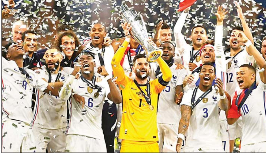
ဖလားဆွတ်ခူးနိုင်ရေးအတွက် နှစ်သင်းစလုံး စာမျက်နှာ ၁၄ ကော်လံ ၁ ❖ နှေးရှင်းလိင်ဖလားဆွတ်ခူးပြီးနောက် ပြင်သစ်ကစားသမားများ အောင်ပွဲခံစဉ်။

ကစားသမားအစုံအလင်ဖြင့် ပွဲထွက်လာသော ကြောင့် ပွဲမှာ အကြိတ်အနယ်ရှိခဲ့ပြီး ပြိုင်ဆိုင်မှု ပြင်းထန်ခဲ့သည်။ ပွဲချိန် ငါးမိနစ်တွင် ပြင်သစ် အသင်းမှ ဘင်ဇီမာ အပိုင်ကန်သွင်းခွင့်ရရှိခဲ့သော် လည်း စပိန်ခံစစ်ကစားသမား အက်စပီလီကျူတာ ရှင်းထုတ်နိုင်ခဲ့သည့်အတွက် နစ်နာခဲ့ရသည်။ ပွဲအစ ပိုင်း မိနစ်များတွင် ဂိုးရရှိနိုင်သည်အထိ စပိန်အသင်း ကို ဖိအားပေးကစားနိုင်ခဲ့သော်လည်း နောက်ပိုင်း ပွဲချိန်များတွင် စပိန်အသင်းကသာ ထိန်းချုပ်ကစား နိုင်ခဲ့သည်။