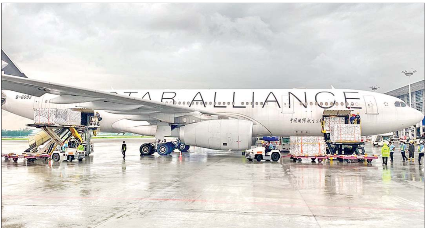
တရုတ်ပြည်သူ့သမ္မတနိုင်ငံမှ Sinopharm အမှတ်တံဆိပ် ကိုဗစ်-၁၉ ရောဂါကာကွယ်ဆေး အကြိမ်ရေလေးသန်း ရန်ကုန်အပြည်ပြည်ဆိုင်ရာလေဆိပ်သို့ စက်တင်ဘာ ၁၂ ရက်က ထပ်မံရောက်ရှိလာစဉ်။

ထို့နောက် နိုင်ငံတော်စီမံအုပ်ချုပ်ရေးကောင်စီ ဥက္ကဋ္ဌ၊ တပ်မတော်ကာကွယ်ရေးဦးစီးချုပ်သည် မြစ်ကြီးနားတပ်နယ်ရှိ အရာရှိ၊ စစ်သည် မိသားစုများနှင့် တွေ့ဆုံ၍ နိုင်ငံတော်ဘက်စုံဖွံ့ဖြိုး တိုးတက်ရေးအတွက် ရှေ့လုပ်ငန်းစဉ် (၅)ရပ်၊ ဦးတည်ချက် (၉)ရပ်ကို ချမှတ်၍ ကြိုးပမ်းဆောင်ရွက်ခြင်း၊ လက်ရှိလုပ်ဆောင်မှုများသည် နိုင်ငံအရေး လုပ်ဆောင်ခြင်းပင်ဖြစ်၍ စစ်မှန်ပြည့်ဝသည့် ပါတီစုံဒီမိုကရေစီစနစ်အပေါ် ခိုင်မာစွာ ရပ်တည်