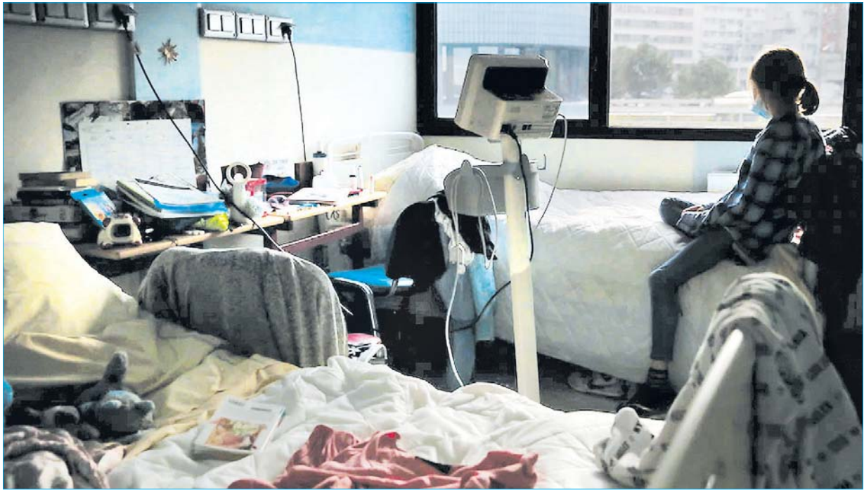
ပြင်သစ်နိုင်ငံ ပါရီမြို့ကလေးဆေးရုံတွင် ပြတင်းပေါက်အပြင်ဘက်ကို ငေးကြည့်နေသည့် ကလေးငယ်တစ်ဦးကို တွေ့ရစဉ်။

ကလေးများနှင့် ဆယ်ကျော်သက်များအတွက် ကျန်းမာရေးကုထုံး