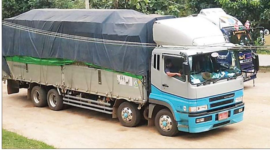
ချင်းရွှေဟော်နယ်စပ်ကုန်သွယ်ရေးစခန်း ကိုဗစ်-၁၉ ရောဂါ ကာကွယ်၊ ကုသရေးပစ္စည်းများ တင်သွင်းလာသည့် ယာဉ်ကို တွေ့ရစဉ်။

PPE အစုံ ၃၃၄၅၀၊ နှာခေါင်းစည်း Mask ၆၄ တန် တင်သွင်းခဲ့ပြီး အောက်ဆီဂျင်အရည် သယ်ယာဉ်တစ်စီးမှာ ရန်ကုန်မြို့သို့ ပို့ဆောင်မည်ဖြစ်သည်။ ကိုဗစ်-၁၉ရောဂါ ကာကွယ် ထိန်းချုပ်၊ ကုသရေးဆိုင်ရာပစ္စည်းများကို ပြည်ပမှတင်သွင်းရာတွင် နှောင့်နှေးကြန့်ကြာမှုမရှိစေရေးအတွက် သက်ဆိုင်ရာဌာနများနှင့် ညှိနှိုင်းထားသည့် လုပ်ငန်းလမ်းညွှန်ချက်များနှင့်အညီ ဦးစားပေးတင်သွင်းခွင့်ပြုပေးလျက် ရှိကြောင်းနှင့် ဆေးဝါးနှင့် ဆက်စပ်ပစ္စည်းများ တင်သွင်းခြင်းနှင့် သက်ဆိုင်သည့် အသိပေးကြေညာချက်များကိုလည်း အများပြည်သူသိရှိစေရန် ဝန်ကြီးဌာန Website ဖြစ်သည့် commerce.gov.mm တွင် ဝင်ရောက်ကြည့်ရှု နိုင်ရေး စီစဉ်ဆောင်ရွက်ပေးထားကြောင်း သိရှိရသည်။ သတင်းစဉ်