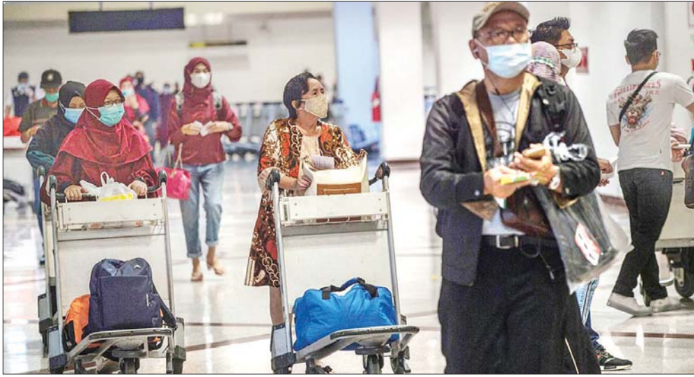
အင်ဒိုနီးရှားလေဆိပ်တစ်ခုတွင် ခရီးသည်များသွားလာနေသည်ကို တွေ့ရစဉ်။

ဂျကာတာ အောက်တိုဘာ ၁၁ အင်ဒိုနီးရှားအစိုးရသည် နိုင်ငံတကာခရီးသည်များ အတွက် ကန့်သတ်စောင့်ကြည့်ကာလကို ရောဂါအစပျိုး ပြောင်းလဲမှုအဆင့်အရ ရှစ်ရက်မှ ငါးရက်အထိ လျော့ချ လိုက်ကြောင်း ပင်လယ်ရေကြောင်းနှင့် ရင်းနှီးမြှုပ်နှံမှု ရေးရာ ညှိနှိုင်းရေးဝန်ကြီး လူဟတ်ဘင်ဆာပန်ဂျိုင်တန် က ပြောသည်။