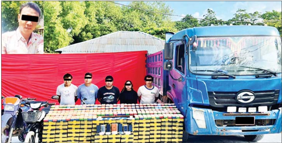
သိမ်းဆည်းရမိသည့် မူးယစ်ဆေးဝါးများနှင့်အတူ တွေ့ရစဉ်။