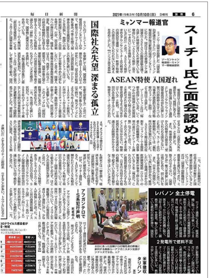
နိုင်ငံတော်စီမံအုပ်ချုပ်ရေးကောင်စီ သတင်းထုတ်ပြန်ရေးအဖွဲ့ခေါင်းဆောင် ဗိုလ်ချုပ် ဇော်မင်းထွန်းအား ဆက်သွယ်မေးမြန်း ဖြေကြားမှုများကို ဖော်ပြထားသည့် အောက်တိုဘာ ၁၀ ရက်ထုတ် Mainichi Shimbun သတင်းစာ။

ရွေးကောက်ပွဲဆိုင်ရာ ကန့်ကွက်ချက်တွေ လုပ်ခဲ့ပါတယ်။ လုပ်ခဲ့တာမှာ ရွေးကောက်ပွဲစနစ်ကတည်းက လုပ်ခဲ့တာပါ။ ဥပမာ ရွေးကောက်ပွဲ မဲလက်မှတ်တွေမှာ မဲပေးတဲ့အမှတ်အသား မထင်အောင် ဖယောင်းသုတ်ထားတယ် ဆိုတာမျိုးက စလို့ပေါ့။ ဒါက ဥပမာအနေနဲ့ ပြောပြတာပါ။ ဒါကြောင့် ၂၀၁၅ ခုနှစ် ရွေးကောက်ပွဲမှာ ရွေးကောက်ပွဲမဲလက်မှတ်တွေ ရိုက်နှိပ်တာကစပြီး UEC က နိုင်ငံရေးပါတီအားလုံးကိုဖိတ်ခေါ်ပြီး ရွေးကောက်ပွဲ လုပ်ငန်းစဉ်အားလုံးကို ခေါ်ပြခဲ့တယ်။ အစစ်ခံခဲ့တယ်။ ရွေးကောက်ပွဲကာလ၊ အပြီးကာလတွေမှာလည်း နိုင်ငံရေးပါတီ၊ ပုဂ္ဂလိကအဖွဲ့အစည်းတွေရဲ့ ကန့်ကွက်မှုတွေကိုလည်း လုပ်ထုံးလုပ်နည်းတွေနဲ့ အညီ ဖြေရှင်းပေးခဲ့ပါတယ်။ မဖြေရှင်းနိုင်တာ ဘာမှမရှိခဲ့ပါဘူး။