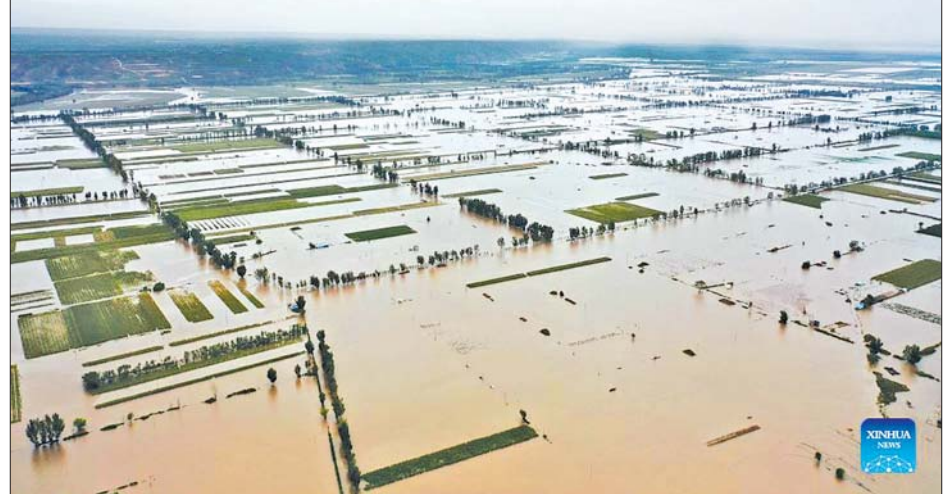
မြစ်ဝမြစ် ရေကြီးမှုကြောင့် ရေလွှမ်းမိုးမှုကို တွေ့ရစဉ်။

သည်ဟု ပြည်နယ်အရေးပေါ် စီမံခန့်ခွဲရေးဌာနက ပြောသည်။ ရေကြီးမှုကြောင့် သီးနှံ စိုက်ခင်း ၁၉၀၀၀၀ ဟက်တာ ပျက်စီးခဲ့ရပြီး နေအိမ်ပေါင်း ၁၇၀၀၀ ပျက်စီးခဲ့ရသည်ဟု အဆိုပါဌာနက ပြောသည်။ ယာယီ တံပေါင်း ၄၀၀၀ နှင့် ခေါက်ခတ်င် ၃၂၀၀၊ အဝတ်အထည်များနှင့် သဘာဝဘေးဒဏ်ကာကွယ်ရေး ပစ္စည်းများကို ခွဲဝေပေးခဲ့သည်ဟု လည်း အရေးပေါ်စီမံခန့်ခွဲရေး ဌာနကပြောသည်။ အစိုးရကလည်း ကယ်ဆယ် ရေးလုပ်ငန်းများ ဆောင်ရွက်ရန် အတွက် အရေးပေါ်တုံ့ပြန်ရေး အဖွဲ့ကို ရေဘေးဒဏ်ခံဒေသသို့ စေလွှတ်ထားကြောင်း သိရသည်။ ဆင်ဟွာ၊ အင်န်အိတ်ချ်ကေ