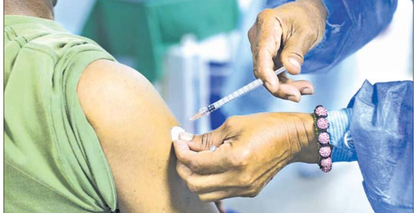
ပင်နီစွဲလားနိုင်ငံကရာကက်စ်မြို့တွင် ဇူလိုင် ၂၁ ရက်ကကိုဗစ် -၁၉ ကာကွယ်ဆေးထိုးပေးနေစဉ်။

ပြည့်မီလာစေနိုင်သည်ဟုလည်း ခန့်မှန်းထား သည်။ ပင်နီစွဲလားနိုင်ငံတွင် ယခုအချိန်အထိ ကိုဗစ်- ၁၉ ကူးစက်ခံရသူ ၃၈၂၂၆၆ ဦးရှိပြီး သေဆုံးသူ ၄၆၀၆၆၅ ခန့်ရှိသည်ဟု သိရသည်။ ဆင်ဟွာ