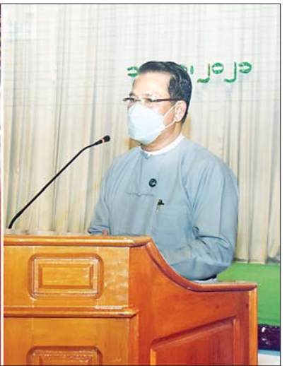
ပြည်ထောင်စုဝန်ကြီး ဦးမောင်မောင်အုန်း ရန်ကုန်တိုင်းဒေသကြီးအတွင်းရှိ နိုင်ငံပိုင်ရုပ်ရှင်ရုံ ၁၃ ရုံနှင့် ပတ်သက်၍ တာဝန်နှင့် ဝတ္တရားများ လွှဲပြောင်းသည့် စာချုပ်(Deed of Assignment)ချုပ်ဆိုခြင်း အခမ်းအနားတွင် အမှာစကားပြောကြားစဉ်။

ရုပ်ရှင်ရုံလုပ်ငန်းများ ဖွံ့ဖြိုးတိုးတက်ရေးအတွက် ပြန်ကြားရေးဝန်ကြီးဌာန၊ တိုင်းဒေသကြီးအစိုးရနှင့် ရုပ်ရှင်ရုံငွားရမ်း လုပ်ကိုင်သူများက ပေါင်းစပ် ဆောင်ရွက်သွားကြမည်ဟု ယုံကြည်ပါကြောင်း။