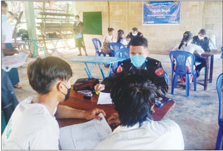
၁၈ နှစ်ပြည့် နိုင်ငံသားစိစစ်ရေးကတ်ပြား ၁၀၄ ဦး၊ လဲလှယ်ခြောက်ဦး၊ မိတ္တူ ၁၃ ဦးတို့ကို ပန်းခင်းစီမံချက်ဖြင့် ကွင်းဆင်းဆောင်ရွက်ပေးကြောင်း သိရသည်။ နှင်းမြူလွင် (ပလောက်)

ပလောက် အောက်တိုဘာ ၁၁ တနင်္လာရက်နေ့တွင် ပလောက်မြို့တွင် လူဝင်မှုကြီးကြပ်ရေးနှင့်ပြည်သူ့အင်အားဝန်ကြီးဌာန ပုလောက်မြို့နယ်ရုံးမှ ပန်းခင်းစီမံချက်ဖြင့် အိမ်ထောင်စုလူဦးရေစာရင်းနှင့် နိုင်ငံသားစိစစ်ရေးကတ်ပြားများကို အောက်တိုဘာ ၈ ရက်မှ ၁၀ ရက်အထိ ပြည်ခြားကျေးရွာအုပ်စု ပြည်ခြားကျေးရွာ၌ ကွင်းဆင်းဆောင်ရွက်ပေးသည်။ ထိုသို့ပြုလုပ်ရာတွင် ပုလောက်မြို့နယ်လူဝင်မှုကြီးကြပ်ရေးမှူးတာဝန်ရှိသူများက ကိုဗစ်-၁၉ ရောဂါ ကာကွယ်ထိန်းချုပ်ရေး လမ်းညွှန်ချက်များနှင့်အညီ အသက် ၁၀ နှစ်ပြည့် နိုင်ငံသားစိစစ်ရေးကတ်ပြား ၃၅၂ ဦး၊ အသက်