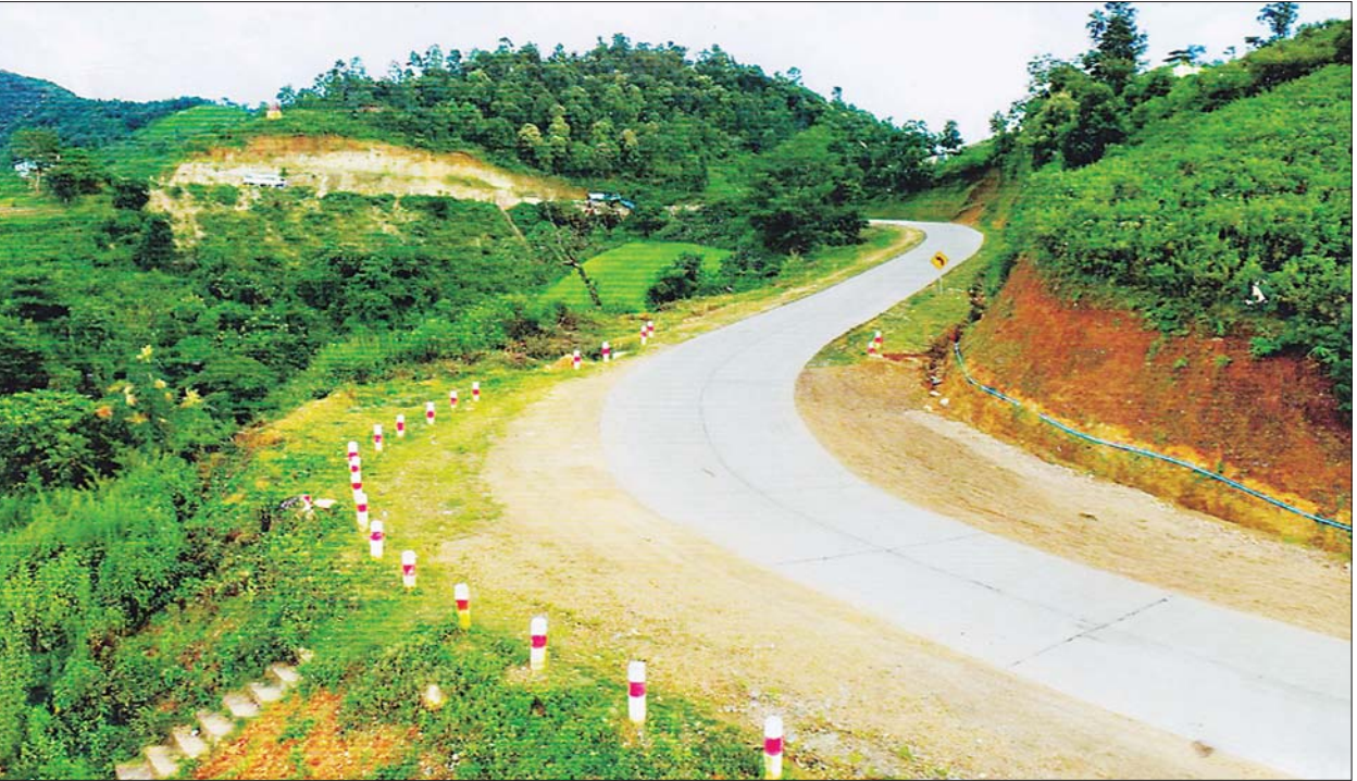
မိတ္ထီလာ - တောင်ကြီး - ကျိုင်းတုံ - တာချီလိတ်လမ်းကို တွေ့ရစဉ်။

ကျိုင်းတုံ အောက်တိုဘာ ၁၁ ရှမ်းပြည်နယ်အရှေ့ပိုင်းအတွင်းရှိ လမ်းပေါင်း ၃၀ ထဲမှ မိတ္ထီလာ - တောင်ကြီး- ကျိုင်းတုံ-တာချီလိတ်လမ်းသည် နိုင်ငံတကာ ဆက်သွယ်ရေးနှင့် အာရှအဆီယံလမ်းမကြီး (AH) ၊ National Highway (NH.27) ဖြစ်သည်။ မိုင်အားဖြင့် ၁၁၃/၃ မိုင်ရှိပြီး ဆောက်လုပ်ရေး ဝန်ကြီးဌာနနှင့် ရှမ်းပြည်နယ် အရှေ့ပိုင်း လမ်းဦးစီးဌာနတို့၏ ကြီးကြပ်မှုဖြင့် လမ်းအထူး အဖွဲ့(၃)မှ (၉၉/၇)မိုင်၊ ကျိုင်းတုံခရိုင်လမ်းဦးစီး ဌာနမှ (၁၁/၃) မိုင် တာဝန်ယူဆောင်ရွက် လျက်ရှိသည်။ ၂၀၂၀-၂၀၂၁ ဘဏ္ဍာရေးနှစ်တွင် လမ်း အထူးအဖွဲ့(၃)နှင့် ကျိုင်းတုံခရိုင်လမ်းဦးစီးဌာန တို့က ၂၃ ပေအကျယ်အား (Ac) လမ်းခင်းခြင်း လုပ်ငန်းကို (၁/၁ ဒသမ ၂) မိုင်၊ ၁၈ ပေ ကတ္တရာ လမ်းချဲ့ခြင်း (၂/၅ ဒသမ ၂) မိုင်၊ သတ်မှတ် တာပေါင်အကျယ်မီစေရန် ကျောက်တောင်၊ ကျောက်ဆွေးတောင်၊ မြေတောင်များချဲ့ခြင်း (၄ /၆ ဒသမ ၃) မိုင်အပါအဝင် လုပ်ငန်းအမျိုး အစားရစ်ခုကို ခွင့်ပြုရန်ပုံငွေ ၄ ဒသမ ၅ ဘီလီယံ အကုန်အကျခံ၍ ဆောင်ရွက်ခဲ့ရာ ယခုအခါ လုပ်ငန်းများအားလုံး ရာနှုန်းပြည့် ဆောင်ရွက်ပြီးပြီဖြစ်ကြောင်း သိရသည်။ အဆိုပါလမ်းအား လမ်းဦးစီးဌာနမှ ရေးဆွဲထားသော နှစ်ရှည်စီမံကိန်း (Master Plan) အရ ၂၃ ပေအကျယ် ကွန်ကရစ် ကတ္တရာ လမ်းအဖြစ် အဆင့်မြှင့်တင်ဆောင်ရွက်ရန် ရည်မှန်းထားကြောင်း သိရသည်။ ခရမ်းစိုးမြင့်